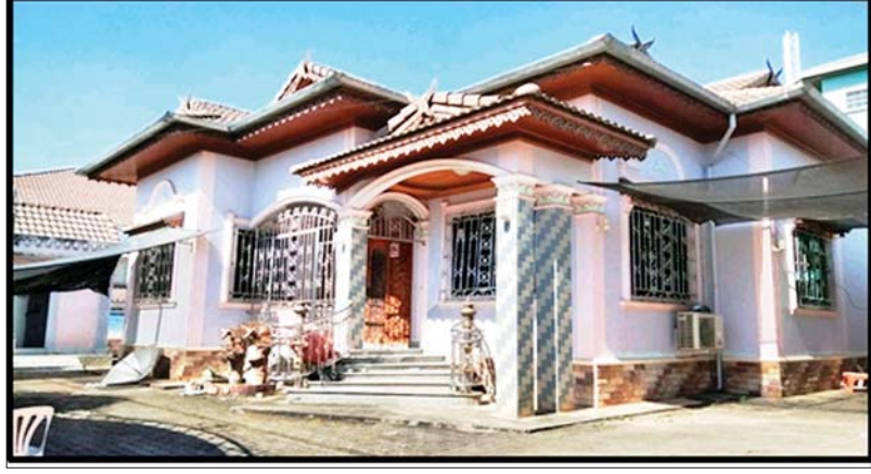
သိမ်းဆည်းရမိသည့် စိတ်ပြောင်းဆေးဝါးများနှင့် နေအိမ်ကို တွေ့ရစဉ်။