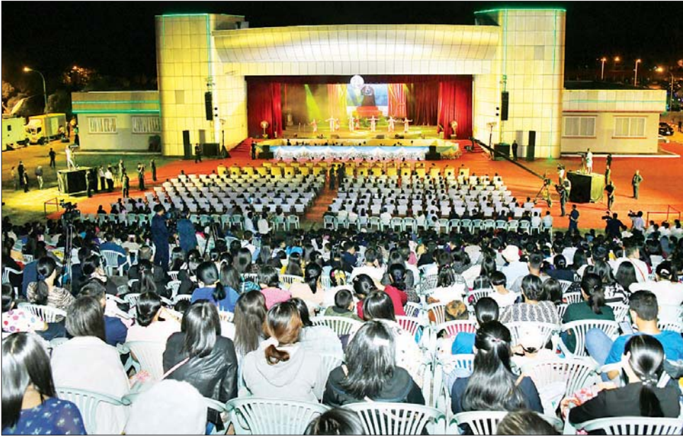
ပဒေသာကပွဲ ကပြဖျော်ဖြေတင်ဆက်နေမှုနှင့် ကြည့်ရှုသူများကို တွေ့ရစဉ်။

ကျင်းပသည့် အကြီးကျယ်ဆုံး ပဒေသာကပွဲကြီးလည်း ဖြစ် သည်။ အဆိုပါ ပဒေသာကပွဲတွင် နိုင်ငံတော်နှင့် ပြည်သူ့အတွက် နိုင်ငံ့ဝန်ထမ်းများနှင့် အနုပညာ ရှင်များက လေးလေးနက်နက် စေတနာပါပါဖြင့် ပူးပေါင်းဆောင် ရွက်ကြခြင်းဖြစ်ကြောင်း သိရပြီး ပဒေသာကပွဲကြီးကို နိုဝင်ဘာ ၂၆ ရက်မှ ၃၀ ရက်အထိ ညနေ ၆ နာရီခွဲမှ ည ၁၁ နာရီအတွင်း ကပြ ဖျော်ဖြေ တင်ဆက်သွားမည် ဖြစ် ကြောင်း သတင်းရရှိသည်။ သတင်းစဉ်