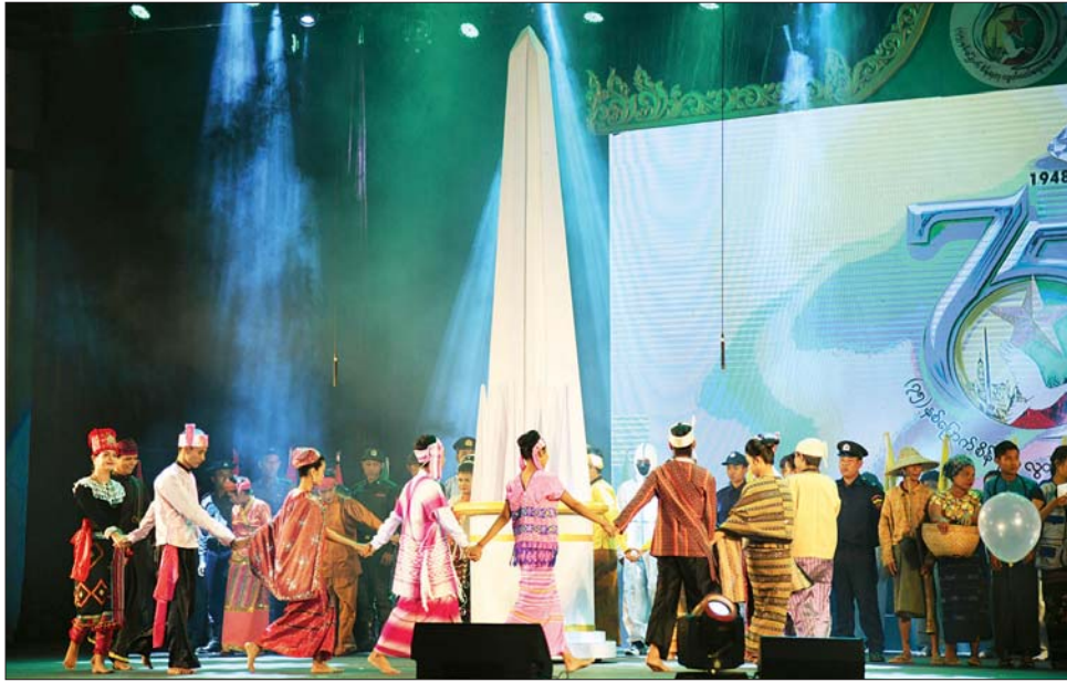
ပဒေသာကပွဲတွင် အနုပညာရှင်များ ဖျော်ဖြေတင်ဆက်နေမှုကို တွေ့ရစဉ်။