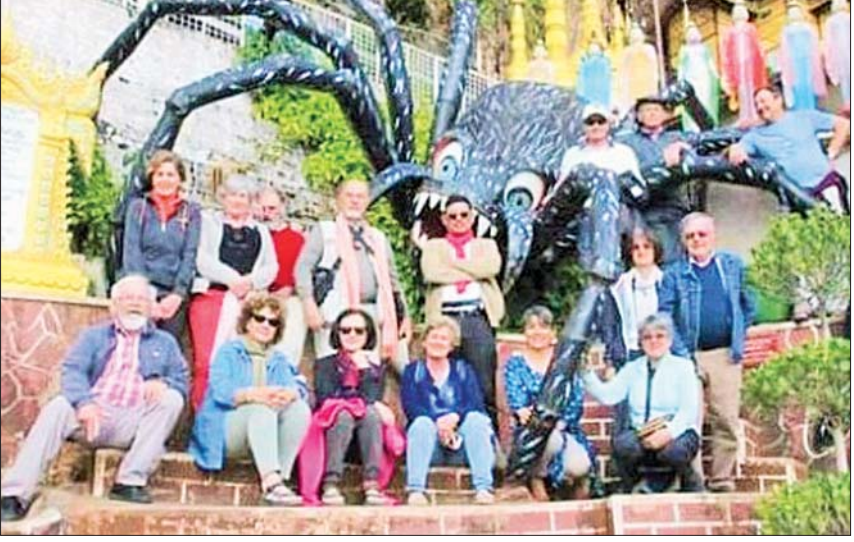
ပင်းတယမြို့နယ်အတွင်း လာရောက်လည်ပတ်ကြသည့် နိုင်ငံခြားခရီးသွားများ။

မြန်မာနိုင်ငံ၌ ဒီဇင်ဘာလတွင် ပြည်တွင်း/ ပြည်ပ ခရီးသွားများစည်ကားလေ့ရှိပြီး ဘုရားဖူး ခရီးစဉ်၊ အလည် အပတ်ခရီးစဉ်နှင့် အပန်းဖြေ ခရီးစဉ်တို့ဖြင့် ဆောင်းရာသီတွင် ခရီးသွား များလေ့ရှိရာ တစ်ဆက်တည်းအဖြစ် ဧပြီလ သင်္ကြန် ကာလအထိ လည်ပတ်ကြလေ့ရှိသည်။ ပြည်ပခရီးသွားဝင်ရောက်မှုအနေဖြင့် ဇန်နဝါရီ လ ဒုတိယပတ်မှစ၍ တစ်ဖွဲ့ဖွဲ့ပြန်လည် ဝင်ရောက်ပြီး သင်္ကြန်ကာလအထိ နိုင်ငံခြား ခရီးသွားများဖြင့် စည်ကားလေ့ရှိသည်။ ၂၀၂၂ ခုနှစ်တွင် ပြည်တွင်း၌ အောက်တိုဘာလနှင့် နိုဝင်ဘာလသည် ရုံးပိတ်ရက်ရှည်တို့ဖြင့် ခရီးသွားလာမှု အများဆုံးလများအဖြစ် ပြည်တွင်းခရီးသွားကဏ္ဍ တိုးတက်ခဲ့ပြီး ယခုနှစ်ကုန်ပိုင်းအထိ အရှိန်ရလာသော ပြည်တွင်း/ပြည်ပ ခရီးသွားမှုသည် ခရီးသွား လုပ်ငန်းပြန်လည်စတင်နိုင်ခဲ့မှု၏ အကျိုးဆက် အဖြစ် ၂၀၂၃ ခုနှစ်၏ ခရီးသွားရာသီ အဖွင့် ကောင်းမွန်မည်ဟု မျှော်မှန်းထားကြခြင်းဖြစ် သည်။