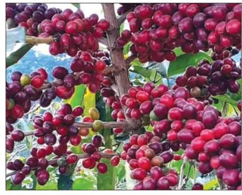
ကော်ဖီသီး အမှည့်သီးများ သီးနေစဉ် တွေ့ရပုံ။