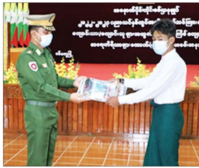
ကိရိယာများနှင့် အသုံးအဆောင် ပစ္စည်းများကို တပ်နယ်အလိုက် ထောက်ပံ့ပေးအပ်ခဲ့ကြကြောင်း သတင်း တာဝန်ရှိသူများက သတိမှတ် ရရှိသည်။ သတင်းစဉ်

နှင့် ကျောင်းသား ကျောင်းသူများ တက်ရောက်ကြသည်။ ဦးစွာ တိုင်းမှူးက အမှာ စကားပြောကြားသည်။ ထို့နောက် တိုင်းမှူးနှင့် တာဝန်ရှိသူများက တပ်မိသားစုဝင် ကျောင်းသား ကျောင်းသူများအား ကျောင်း ဝတ်စုံများ၊ စာရေးကိရိယာများနှင့် အသုံးအဆောင် ပစ္စည်းများ ထောက်ပံ့ပေးအပ်ပြီး တက် ရောက်လာကြသူများအား ရင်းရင်း နှီးနှီးလိုက်လံနှုတ်ဆက်သည်။ အလားတူ တိုင်းစစ်ဌာနချုပ် ကွပ်ကဲမှုအောက် တပ်နယ်များ၌ လည်း တပ်မိသားစုဝင် ကျောင်းသား ကျောင်းသူများအား ကျောင်းဝတ်စုံများ၊ စာရေး