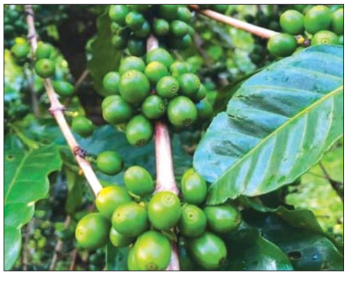
ကော်ဖီပင်တွင် ကော်ဖီသီး အစိမ်းသီး သီးနေစဉ် တွေ့ရပုံ။

ကော်ဖီဖျော်ရာမှ ထွက်ပေါ်လာသော မွှေးကြိုင်သင်းယျံသည့် ကော်ဖီရနံ့နှင့် အတူ ကော်ဖီ၏ထူးကဲသော အရသာတို့ကြောင့် ကော်ဖီချစ်သူတို့ နှစ်သက်စွဲလမ်းနေကြခြင်းဖြစ်သည်။ မြန်မာနိုင်ငံသည် ကော်ဖီစိုက်ပျိုးရန် ရေခဲမြေခဲကောင်းသော နိုင်ငံတစ်နိုင်ငံဖြစ်သည်။ မျိုးကောင်းနိုင်ငံတကာအဆင့်မီ အနံ့အရသာနှင့် ပြည့်စုံသော မြန်မာ့ကော်ဖီများကို မြန်မာ့ ရေမြေမှ စိုက်ပျိုးဖြစ်ထွန်း အောင်မြင်လျက်ရှိသည်။