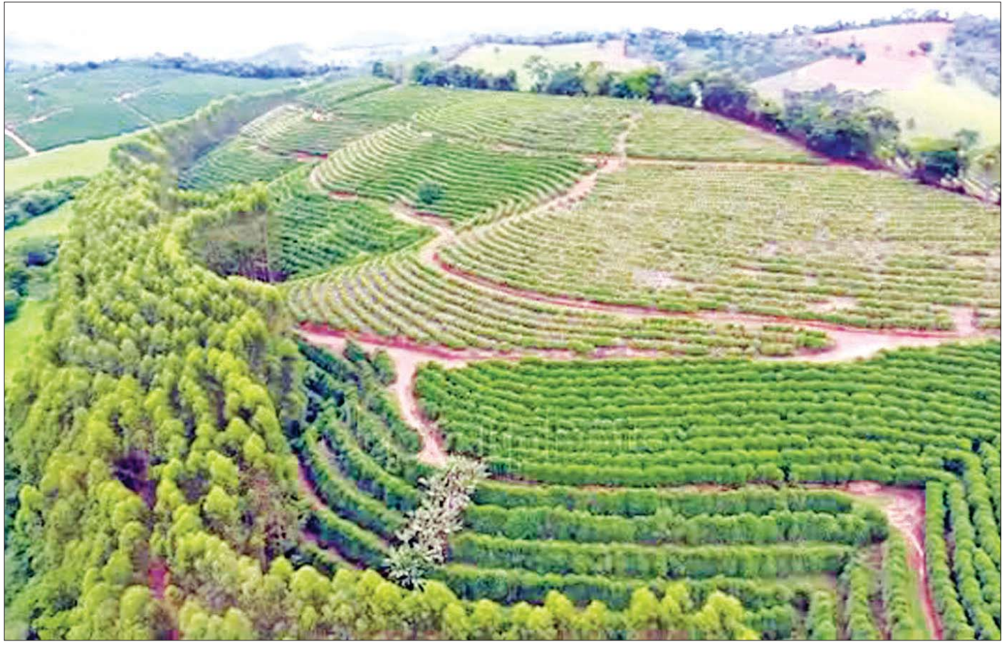
ယူဂန္ဓာနိုင်ငံရှိ ကော်ဖီစိုက်ခင်းများကို တွေ့ရစဉ်။

မကြာသေးမီက ဆင်ဟွာနဲ့ပြုလုပ်တဲ့ အင်တာဗျူးတစ်ခုမှာ နန်ဂိုလီက ၁၉၇၀ ပြည့်နှစ်တွေမှာ နိုင်ငံရေး မတည်ငြိမ်မှုတွေကြောင့် အခက်အခဲတွေနဲ့ ကြုံတွေ့ခဲ့ရပြီး အိမ်နီးချင်း ကင်ညာနိုင်ငံကို ကော်ဖီပင်ပို့သွင်းခဲ့ရတယ်လို့ ပြောပါတယ်။