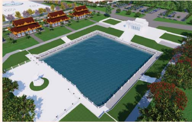
ကျောက်စာရုံစေတီ(၁၂ x ၁၂x ၁၈)ပေ ခု တန်ဖိုး-၂၇၉ သိန်း