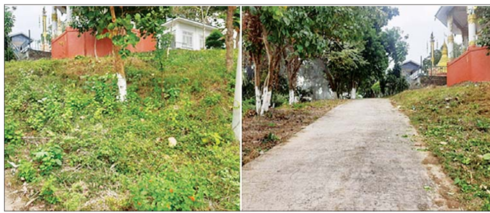
နေပြည်တော်ကောင်စီနယ်မြေ ဒက္ခိဏသီရိမြို့နယ် တောင်ပိုင်းကြီးဘုရားတွင် သန့်ရှင်းရေး မဆောင် ရွက်မီနှင့် ဆောင်ရွက်အပြီး တွေ့ရစဉ်။

နေပြည်တော် နိုဝင်ဘာ ၂၆ ယခုအချိန်အခါတွင် နိုင်ငံတော်စီမံ အုပ်ချုပ်ရေးကောင်စီ၏ ဦးဆောင် မှုနှင့်အတူ နိုင်ငံတစ်ဝန်းလုံး၌ အုပ်ချုပ်ရေး အဖွဲ့အစည်းများ၊ ဒေသခံ ပြည်သူများအားလုံးက နိုင်ငံတော် ဖွံ့ဖြိုးတိုးတက်ရေး လုပ်ငန်းများကို ညီညီညွတ်ညွတ် ဖြင့် ဆောင်ရွက်လျက်ရှိကြပြီး အပတ်စဉ် စနေနေ့တိုင်းတွင် လည်း မိမိတို့၏ မြို့၊ ရွာ ဒေသများ သန့်ရှင်းသာယာ လှပရေးကို အားတက်သရော ဆောင်ရွက် လျက်ရှိကြသည်။