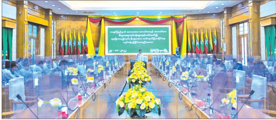
အခမ်းအနားကို တင်ပြဆွေးနွေးခဲ့ကြသည်။ အတွက် လိုအပ်သည်များကို ဌာနဆိုင်ရာများနှင့် ချိတ်ဆက်ဆောင်ရွက်နိုင်ရေး ညှိနှိုင်းပေါင်းစပ်ဆောင်ရွက်ပေးခဲ့ကြောင်း သိရသည်။ ပြည်နယ် (ပြန်/ဆက်)

လုပ်ငန်းများ ဖွံ့ဖြိုးတိုးတက်စေရေးနှင့် ထုတ်ကုန်များ ပိုမိုတိုးမြှင့်ထုတ်လုပ်နိုင်ရေးအတွက် အားပေးဆောင်ရွက်လျက်ရှိကြောင်း၊ သို့ဖြစ်ပါ၍ ပြည်နယ်အတွင်းရှိ MSME စီးပွားရေးလုပ်ငန်းရှင်များအနေဖြင့် မိမိတို့ထုတ်ကုန်များကို ပိုမိုထိရောက်အောင်မြင်ရေးနှင့် ဈေးကွက်ခိုင်မာလာစေရေးအတွက် ပြည်တွင်းပြုလုပ်သည့်အခမ်းအနားများ၊ ထုတ်ကုန်ပြပွဲ/ပြိုင်ပွဲအစီအစဉ်များတွင် ခင်းကျင်းပြသရောင်းချရန် လိုအပ်သည်များကို ဝိုင်းဝန်းအကြံပြု ဆွေးနွေးကြစေလိုကြောင်း တိုက်တွန်းမှာကြားသည်။ ယင်းနောက် ပြည်နယ်လုံခြုံရေးနှင့် နယ်စပ်ရေးရာဝန်ကြီး ဗိုလ်မှူးကြီး အောင်ကြည်လင်းနှင့် တက်ရောက်လာကြသည့် ပြည်နယ်အတွင်းရှိ MSME စီးပွားရေးလုပ်ငန်းရှင်များက ပြခန်းခင်းကျင်းပြသသွားမည့် အစီအစဉ်များအတွက် လိုအပ်ချက်၊ အခက်