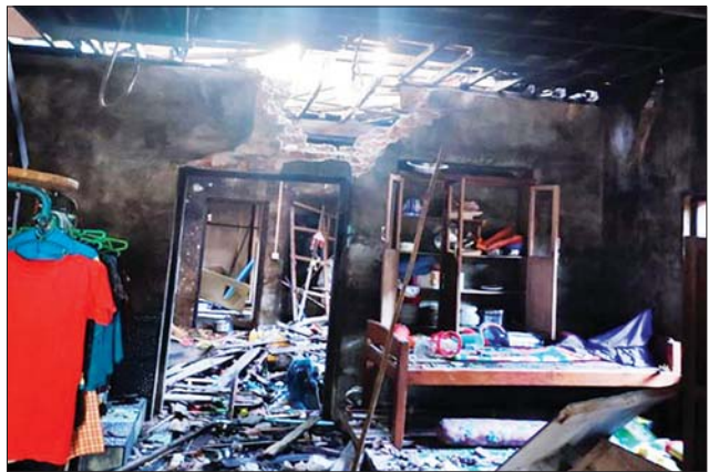
PDF အမည်ခံအကြမ်းဖက်သမားများက ပုလောမြို့နယ် ပလမြို့ အမှတ်(၃) ရပ်ကွက်၌ ရွှေထည်ပစ္စည်းများ၊ ငွေကြေးများ သေနတ်ပြ ခြိမ်းခြောက်ယူဆောင်ခဲ့ပြီး နေအိမ်ကို မိုင်းခွဲဖျက်ဆီးခဲ့မှု မှတ်တမ်း ဓာတ်ပုံ။

နေအိမ်အတွင်း လက်လုပ်မိုင်း နှစ်လုံး ထောင်ထားခဲ့ပြီး အဆိုပါ PDF အမည်ခံ အကြမ်းဖက်သမား များသည် မြောက်ဘက်သို့ ထွက်ပြေးသွားခဲ့ကြောင်း သိရှိရ သည်။ မိုင်းနှစ်လုံးထောင်ထားခဲ့ အထက်ပါ ဖြစ်စဉ်နေရာသို့ လိုခြံရေး တပ်ဖွဲ့ဝင်များက သွားရောက်စစ်ဆေးခဲ့ပြီး နေအိမ် အတွင်း PDF အမည်ခံ အကြမ်း ဖက်သမားများ ထောင်ထားခဲ့ သည့် မိုင်းနှစ်လုံးကို လုပ်ထုံး လုပ်နည်းနှင့်အညီ ဆောင်ရွက်ခဲ့ ကြောင်းနှင့် အဆိုပါ PDF အမည်ခံ အကြမ်းဖက်သမားများ အား ဖမ်းဆီးရမိနိုင်ရေး လိုအပ် သော ပိတ်ဆို့ရှာဖွေစစ်ဆေးခြင်း များ ဆက်လက်ဆောင်ရွက်လျက် ရှိကြောင်း သတင်းရရှိသည်။ သတင်းစဉ်