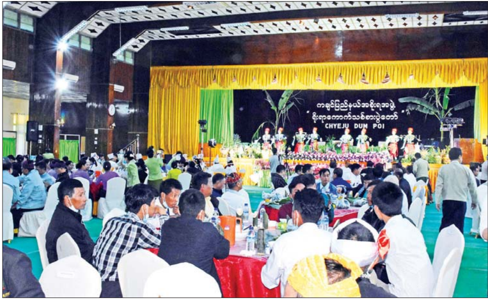
ရိုးရာကောက်သစ်စားပွဲတော်သို့ တက်ရောက်လာသည့် ဌာနဆိုင်ရာများနှင့် ပြည်သူများ။

ဆက်လက်၍ ပြည်နယ်ဝန်ကြီးချုပ်နှင့်ဇနီး ဒေါ်နန်ဆိုင်တို့က ကောက်ဦးပလိုင်လက်ဆောင်များ ကို ပြည်နယ်တရားလွှတ်တော် တရားသူကြီးချုပ်၊ တပ်မတော်အရာရှိကြီးများ၊ ပြည်နယ်အစိုးရအဖွဲ့ဝင် များထံသို့ လည်းကောင်း၊ ကောက်ဦးပလိုင်နှင့် အလှူငွေများကိုဘာသာရေးအသင်းတော်ခေါင်းဆောင် များထံလည်းကောင်း တစ်ဦးချင်းပေးအပ်ခဲ့ကြသည်။