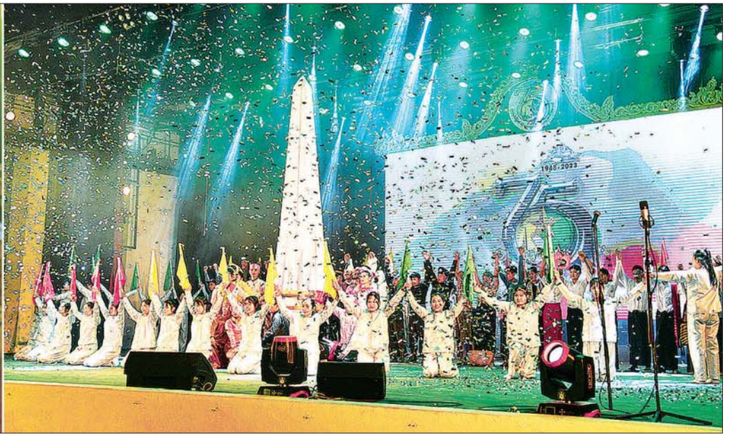
နိုင်ငံတော်စီမံအုပ်ချုပ်ရေးကောင်စီဥက္ကဋ္ဌ နိုင်ငံတော်ဝန်ကြီးချုပ် ဗိုလ်ချုပ်မှူးကြီး မင်းအောင်လှိုင်နှင့် ဇနီး ဒေါ်ကြူကြူလှ ၂၀၂၃ ခုနှစ် စိန်ရတုလွတ်လပ်ရေးနေ့ ပဒေသာကပွဲ ဖွင့်ပွဲအခမ်းအနားသို့ တက်ရောက်အားပေးကြည့်ရှုစဉ်။