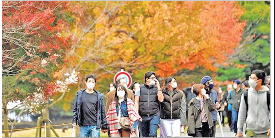
ဧကရာဇ်နန်းတော်ဝင်းအတွင်းရှိ အိန္ဒိယလမ်း၌ လာရောက်လည်ပတ်သူများကို တွေ့ရစဉ်။

၉ နာရီတွင် ဝင်ပေါက်ကိုဖွင့်ပေးခဲ့ကြောင်း သိရသည်။ မိုးရွာနေသည့် ကောင်းကင်အောက်တွင် မျိုးကွဲရစ်မျိုးရှိသည့် မေပယ်ပင် ၇၀ ဝန်းကျင် စီတန်းနေသော အရှည် မီတာ ၆၀၀ ရှိသည့် လမ်းကြောင်းအတိုင်း ပြည်သူများ လမ်းလျှောက် လျက်ရှိကြောင်း သိရသည်။ လမ်းကြောင်း မကြာခဏ ပြည့်ကျပ်နေသောကြောင့် နန်းတော်၏ အရှေ့ဥယျာဉ်ကို ဖြတ်လျှောက်သည့် လမ်းကြောင်းကို ယခုနှစ်တွင် ပိတ်ထားခဲ့ကြောင်း၊ လာရောက်လည်ပတ်သူများသည် ဆာကာရှိတာ-မွန် ဂိတ်မှတစ်ဆင့်ဝင်ရောက်ပြီး အိန္ဒိယ-မွန် ဂိတ်မှ တစ်ဆင့် ထွက်ရမည်ဖြစ်သည်။ အိန္ဒိယ လမ်းကို ဒီဇင်ဘာ ၄ ရက်အထိ ပြည်သူများအတွက် ဖွင့်လှစ်ထားမည် ဖြစ်ကြောင်း သိရသည်။ အင်န်အိတ်ချ်က