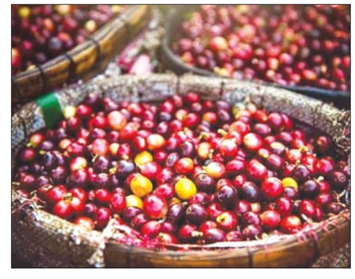
ရောင်းတန်းဝင် ကော်ဖီသီးများကို ခြင်းတောင်းများဖြင့် ထည့်သွင်းထားစဉ်။

ယင်းမြန်မာနိုင်ငံမှ စိုက်ပျိုး ထုတ်လုပ်သော မြန်မာ့မျိုးကောင်း ကော်ဖီများကို ကမ္ဘာ့နိုင်ငံအသီးသီးသို့ တင်ပို့ ရောင်းချရာတွင် ကော်ဖီကြိုက်နှစ် သက်သော နိုင်ငံများက မြန်မာ့ကော်ဖီကို နှစ်သက် လက်ခံဝယ်ယူလျက် ရှိနေကြ သည်။ နိုင်ငံအသီးသီးသို့ တင်ပို့ရောင်းချ သော မြန်မာ့ကော်ဖီများကို မြန်မာနိုင်ငံ အတွင်းရှိ ပြည်နယ်/ တိုင်းဒေသကြီးများ တွင် ကော်ဖီကို နှစ်မျိုးနှစ်စား စိုက်ပျိုး လျက်ရှိကြသည်။ ယင်းတို့မှာ ပေ ၃၀၀၀ မှ ပေ ၆၀၀၀ အတွင်း အောင်မြင်ဖြစ်ထွန်း သော တောင်ပေါ်ကော်ဖီ (ခေါ်) အာရေ ဗီးကားကော်ဖီနှင့် မြေပြန့်ဒေသတွင် စိုက်ပျိုးဖြစ်ထွန်းအောင်မြင်သော မြေပြန့် ကော်ဖီ ရိုဘက်စတာကော်ဖီတို့ ဖြစ်ကြ သည်။