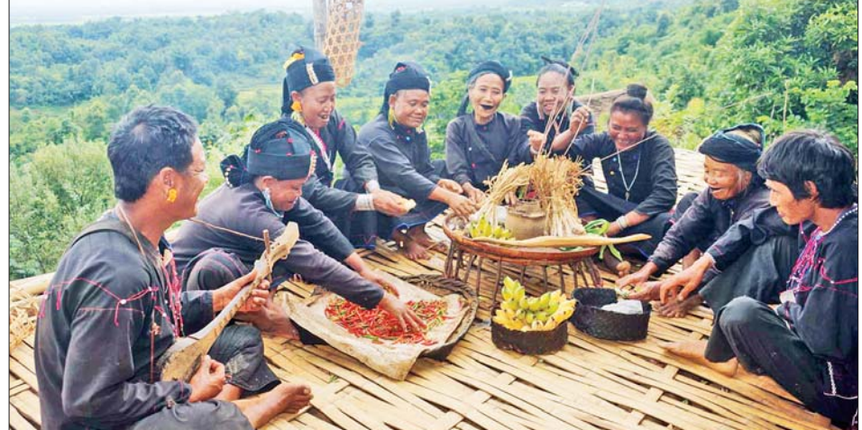
ရိုးရာနတ်ပူဇော်ပွဲ ကျင်းပနေသည့် အဲန်လူမျိုးစုဝင်များ။

ရှမ်းပြည်နယ် (အရှေ့ပိုင်း) ကျိုင်းတုံမြို့နယ် ပင်းတောက်ကျေးရွာအုပ်စု တောင်ပေါ်ဒေသရှိ နမ့်လင်းမိုင်ကျေးရွာမှာ အဲန်လူမျိုး အများစု နေထိုင်ကြပါတယ်။ အဲန်လူမျိုးများဟာ အနက်ရောင်ဝတ်စုံကိုသာ ကိုယ်တိုင် ဖန်တီးရက်လုပ်ပြီး ရှေးရိုးဆန်ဆန် ဝတ်ဆင်ကြပါတယ်။ သွားတွေကို မည်းနေမှလုပ်တယ် လို့ ယူဆကြတဲ့အတွက် သူတို့ရဲ့ သွားတွေကို မည်းနေအောင် ပြုလုပ်ထားကြပါတယ်။ အမျိုးသားအများစုကို ဆံပင်ရှည်ကြီးများနဲ့ ရှေးရိုးဆန်စွာ မြင်တွေ့ရပါတယ်။ အဲန်လူမျိုးများရဲ့ ရှေးကျတဲ့ နေထိုင်မှုပုံစံတွေကို ထူးခြားစွာ တွေ့မြင်ရတဲ့ ဒီဒေသဟာ နိုင်ငံခြားသား ခရီးသွားတွေကို ဆွဲဆောင်နိုင်ပါတယ်။