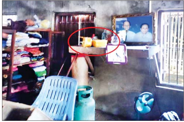
PDF အမည်ခံအကြမ်းဖက်သမားများက ပုလောမြို့နယ် ပလမြို့ အမှတ်(၃) ရပ်ကွက်၌ ရွှေထည်ပစ္စည်းများ၊ ငွေကြေးများ သေနတ်ပြ ခြိမ်းခြောက်ယူဆောင်ခဲ့ပြီး နေအိမ်ကို မိုင်းခွဲဖျက်ဆီးခဲ့မှုနှင့် မိုင်းနှစ်လုံးထောင်ထားခဲ့မှုကို တွေ့ရစဉ်။