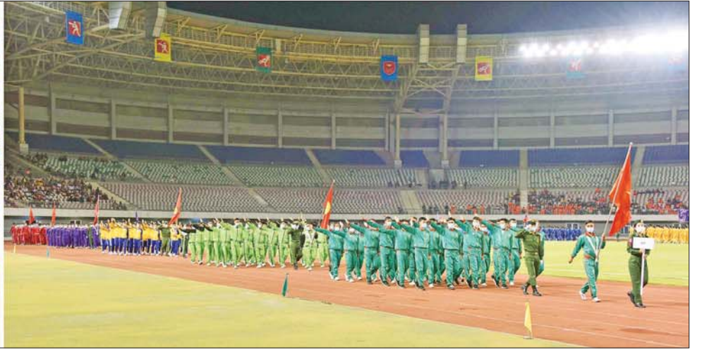
နိုင်ငံတော်စီမံအုပ်ချုပ်ရေးကောင်စီဥက္ကဋ္ဌ တပ်မတော်ကာကွယ်ရေးဦးစီးချုပ် ဗိုလ်ချုပ်မှူးကြီး မင်းအောင်လှိုင်၊ ဇနီး ဒေါ်ကြူကြူလှနှင့် တက်ရောက်လာကြသူများအား စစ်ရေးပြပွဲကြီး ဦးဆောင်သော အလံတော် အဖွဲ့၊ အားကစားအသင်း ၁၇ သင်းနှင့် တပ်မတော် (ကြည်း၊ ရေ၊ လေ) ကိုယ်စားပြု စစ်တီးဝိုင်းအဖွဲ့တို့က စစ်ကြောင်းပုံဖြင့် ချီတက်လက်ဝှေ့ယမ်းနှုတ်ဆက်ကြစဉ်။