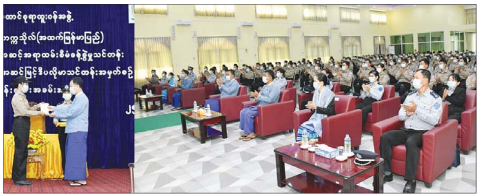
ပြည်ထောင်စုရာထူးဝန်အဖွဲ့ ဥက္ကဋ္ဌ ဒေါက်တာမောင်မောင်နိုင် သင်တန်းဆင်းလက်မှတ် ပေးအပ်စဉ်။

အရာအသစ်များကို စဉ်ဆက်မပြတ် လေ့လာ သင်ယူ နေရုံသာမက ခေတ်စနစ်နှင့် လိုက်လျောညီထွေ သော အတွေးအခေါ်၊ ဗဟုသုတများ တိုးတက်စေရေး အမြဲရှေးရှုဆောင်ရွက်ကြရန် တိုက်တွန်းပြောကြား ပြီး ထူးချွန်ဆုရရှိသူများကို ဆုများချီးမြှင့် ပေးအပ်သည်။ အဆိုပါ သင်တန်းသို့ သင်တန်းသား ၉၃ ဦး၊ သင်တန်းသူ ၃၇၈ ဦး စုစုပေါင်း ၄၇၁ ဦး တက်ရောက် ကြပြီး သင်တန်းကာလမှာ အောက်တိုဘာ ၂၅ ရက် မှ နိုဝင်ဘာ ၂၅ ရက်အထိ ကြာမြင့်ခဲ့ကြောင်း သိရ သည်။ ဆက်လက်၍ ပြည်ထောင်စုရာထူးဝန်အဖွဲ့ ဥက္ကဋ္ဌသည် တာဝန်ရှိသူများနှင့်အတူ နီလာခန်းမ၌ ကျင်းပသည့် အလယ်အလတ်အဆင့် အရာထမ်း စီမံ ခန့်ခွဲမှုသင်တန်း၊ ပြည်သူ့ဝန်ထမ်းစီမံခန့်ခွဲမှု