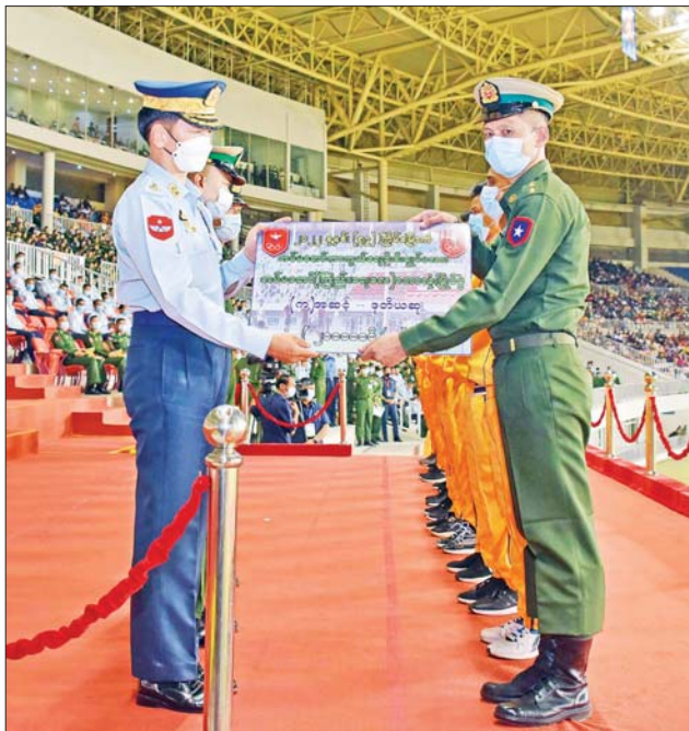
ကာကွယ်ရေးဦးစီးချုပ် (လေ) ဗိုလ်ချုပ်ကြီး ထွန်းအောင် (က)အဆင့် ပြိုင်ပွဲတွင် ဒုတိယဆုရရှိသည့် အလယ်ပိုင်းတိုင်းစစ်ဌာနချုပ် ကိုယ်စားပြုအသင်းအား ငွေသားဆု ပေးအပ်ချီးမြှင့်စဉ်။