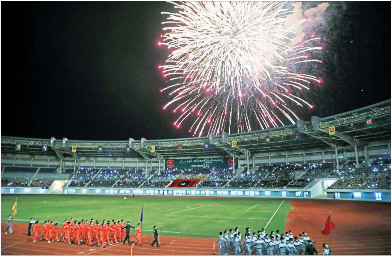
၂၀၂၂ ခုနှစ် တပ်မတော် (ကြည်း၊ ရေ၊ လေ) အားကစားပြိုင်ပွဲ ဆုချီးမြှင့်ပွဲအခမ်းအနား အောင်မြင်ခြင်းအထိမ်းအမှတ်အဖြစ် မီးရှူး၊ မီးပန်းများကို ဂုဏ်ပြုပစ်ဖောက်စဉ်။

ထိုသို့ ချီတက်ထွက်ခွာနေချိန်တွင် (၅၉) ကြိမ်မြောက် တပ်မတော်ကာကွယ်ရေး ဦးစီးချုပ်ဖလား (ကြည်း၊ ရေ၊ လေ) ဘောလုံးပြိုင်ပွဲ ဆုချီးမြှင့်ပွဲအခမ်းအနားနှင့် ၂၀၂၂ ခုနှစ် တပ်မတော် (ကြည်း၊ ရေ၊ လေ) အားကစားပြိုင်ပွဲ ဆုချီးမြှင့်ပွဲအခမ်းအနားအောင်မြင်ခြင်း အထိမ်းအမှတ်အဖြစ် မီးရှူး၊ မီးပန်းများကို ဂုဏ်ပြုပစ်ဖောက်ခဲ့ပြီး အခမ်းအနားကို အောင်မြင်စွာ ပိတ်သိမ်းခဲ့ကြောင်း သတင်းရရှိသည်။