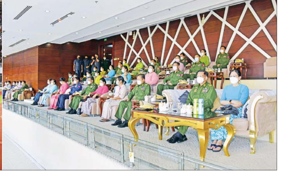
နိုင်ငံတော်စီမံအုပ်ချုပ်ရေးကောင်စီဥက္ကဋ္ဌ တပ်မတော်ကာကွယ်ရေးဦးစီးချုပ် ဗိုလ်ချုပ်မှူးကြီး မင်းအောင်လှိုင်၊ ဇနီး ဒေါ်ကြူကြူလှနှင့်အဖွဲ့ဝင်များ ၂၀၂၂ ခုနှစ်၊ (၅၉) ကြိမ်မြောက် တပ်မတော်ကာကွယ်ရေး ဦးစီးချုပ်ဖလား (ကြည်း၊ ရေ၊ လေ)ဘောလုံးပြိုင်ပွဲ (က) အဆင့် ဗိုလ်လုပွဲအဖြစ် အလယ်ပိုင်းတိုင်းစစ်ဌာနချုပ် ကိုယ်စားပြုအသင်းနှင့် ရန်ကုန်တိုင်းစစ်ဌာနချုပ် ကိုယ်စားပြုအသင်းတို့ ယှဉ်ပြိုင်ကစားနေမှုကို ကြည့်ရှုအားပေးစဉ်။