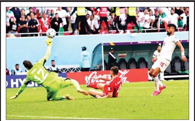
အီရန်အသင်းအတွက် အနိုင်သေချာစေမည့် ဒုတိယဂိုးကို ရေဒီအိန်း သွင်းယူစဉ်။