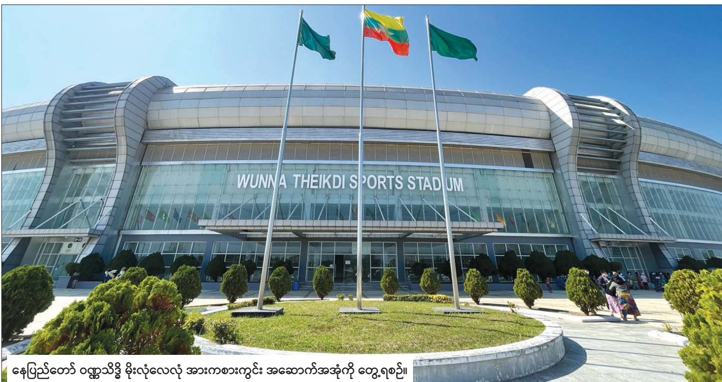
နေပြည်တော် ဝဏ္ဏသိဒ္ဓိ မိုးလုံလေလုံ အားကစားကွင်း အဆောက်အအုံကို တွေ့ရစဉ်။

စိန်ရတုလွတ်လပ်ရေးနေ့တွင် ပြည်ထောင်စု ဝန်ကြီးဌာနများ၏ စစ်ရေးပြစစ်ကြောင်းများ၊ ဝန်ကြီးဌာနများနှင့် ပြည်နယ်နှင့် တိုင်းဒေသကြီး များ၏ ဂုဏ်ပြုယာဉ်များက ဗိုလ်ရှစ်ရင်ပြင်တွင် နိုင်ငံတော်စီမံအုပ်ချုပ်ရေးကောင်စီဥက္ကဋ္ဌ နိုင်ငံတော် ဝန်ကြီးချုပ်အား ချီတက်အလေးပြုကြမည် ဖြစ်ပါ သည်။ ထို့ပြင် ပြည်ထောင်စုဝန်ကြီး ဌာနအလိုက် ပြခန်းများ၊ တိုင်းဒေသကြီးနှင့် ပြည်နယ်များ၏ ဂုဏ်ပြုယာဉ်များနှင့် တိုင်းဒေသကြီးနှင့် ပြည်နယ် များ၏ ရိုးရာအစားအသောက်များနှင့် ဒေသ ထွက်ကုန်များကို ခင်းကျင်းပြသရောင်းချမည့် အစီအစဉ်များကိုလည်း ဥပွဲတသန္နိစေတီတော် မြတ်ကြီး၏ တောင်ဘက်တပေါင်းကွင်းအတွင်း ဆောင်ရွက်မည်ဖြစ်ပါသည်။ ထို့ပြင် ဝန်ကြီးဌာန ပေါင်းစုံ အားကစားပြိုင်ပွဲများနှင့် တိုင်းဒေသကြီး နှင့် ပြည်နယ် (အလွတ်တန်းဖိတ်ခေါ်) အားကစား ပြိုင်ပွဲများကိုလည်း ဝဏ္ဏသိဒ္ဓိ Sport Complex အတွင်း စည်ကားသိုက်မြိုက်စွာ ကျင်းပပြုလုပ် မည်ဖြစ်ပါသည်။