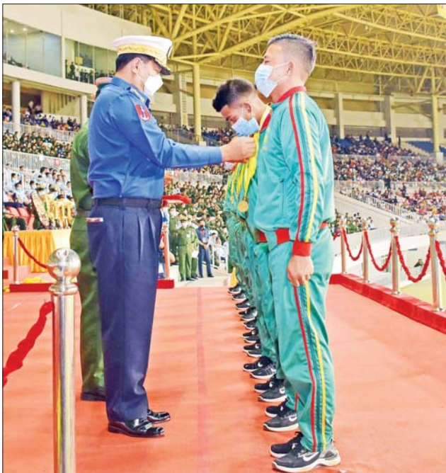
ကာကွယ်ရေးဦးစီးချုပ် (ရေ) ဗိုလ်ချုပ်ကြီး မိုးအောင် (ခ)အဆင့် ပြိုင်ပွဲတွင် ပထမဆုရရှိသည့် အရှေ့မြောက်တိုင်းစစ်ဌာနချုပ် ကိုယ်စားပြုအသင်းအား တစ်ဦးချင်းဆုတံဆိပ်များ ပေးအပ် ချီးမြှင့်စဉ်။