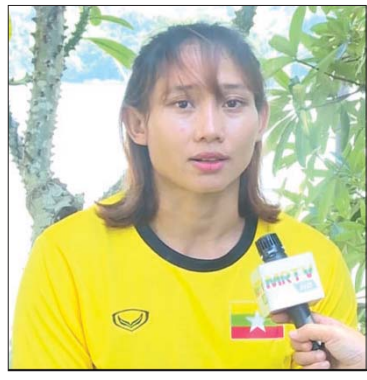
မသက်ဖြိုးနိုင်