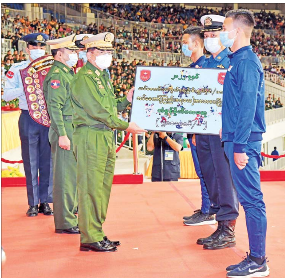
နိုင်ငံတော်စီမံအုပ်ချုပ်ရေးကောင်စီဥက္ကဋ္ဌ တပ်မတော်ကာကွယ်ရေးဦးစီးချုပ် ဗိုလ်ချုပ်မှူးကြီး မင်းအောင်လှိုင် ၂၀၂၂ ခုနှစ်၊ တပ်မတော် (ကြည်း၊ ရေ၊ လေ) အားကစားပြိုင်ပွဲများတွင် ဆုအများဆုံးရရှိသည့် ကာကွယ်ရေး ဦးစီးချုပ်ရုံး (ရေ) ကိုယ်စားပြုအသင်းအား ငွေသားဆု ပေးအပ်ချီးမြှင့်စဉ်။

ဖိတ်ကြားထားသူများနှင့် ပြိုင်ပွဲ ဝင် အားကစားသမားများ တက်ရောက်ကြသည်။ အကြိတ်အနယ်ယှဉ်ပြိုင် ဦးစွာ ၂၀၂၂ခုနှစ်၊ (၅၉) ကြိမ် မြောက် တပ်မတော်ကာကွယ်ရေး ဦးစီးချုပ်ဖလား (ကြည်း၊ ရေ၊ လေ) ဘောလုံးပြိုင်ပွဲ (က) အဆင့် ဗိုလ်လုပွဲအဖြစ် အလယ်ပိုင်းတိုင်း စစ်ဌာနချုပ် ကိုယ်စားပြုအသင်း နှင့် ရန်ကုန်တိုင်းစစ်ဌာနချုပ် ကိုယ်စားပြုအသင်းတို့ ယှဉ်ပြိုင် ကစားကြရာ ဗိုလ်လုပွဲသို့ တက်ရောက်လာနိုင်သည့် အသင်း နှစ်သင်း ဖြစ်သည်နှင့်အညီ တစ်ဖက်နှင့်တစ်ဖက် အကြိတ် အနယ်၊ အပြန်အလှန် ထိုးဖောက် တိုက်စစ်ဆင် ကစားခဲ့ကြပြီး ရှေ့တန်း တိုက်စစ်ကစားသမား များ၏ အဆုံးသတ်ပိုင်းလိုအပ်ချက် ရှိမှု၊ ဂိုးသမားများ၏ လက်စွမ်းပြ ကာကွယ်မှုများကြောင့် သာမန်ပွဲ ကစားချိန်အတွင်း တစ်ဖက်နှင့် တစ်ဖက် ဂိုးရရှိခြင်း မရှိခဲ့သဖြင့် အချိန်ပို ဆက်လက်ယှဉ်ပြိုင် ကစားခဲ့ရသည်။ အချိန်ပို ပထမ ပိုင်း ၆ မိနစ်တွင် ရန်ကုန်တိုင်း