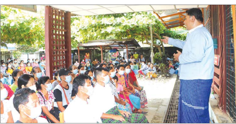
ချေးငွေမည့် တောင်သူများအား ချေးငွေစည်းကမ်းချက်များ ရှင်းပြနေစဉ်။

ယခင် ၂၀၂၁ ခုနှစ်တွင် ကချင်ပြည်နယ်အတွင်း မြို့နယ်ခုနစ်မြို့နယ်မှ ကျေးရွာအုပ်စုပေါင်း ၆၄ အုပ်စုရှိ တောင်သူပေါင်း ၂၅၄၄ ဦး၏ နွေစပါးနှင့်