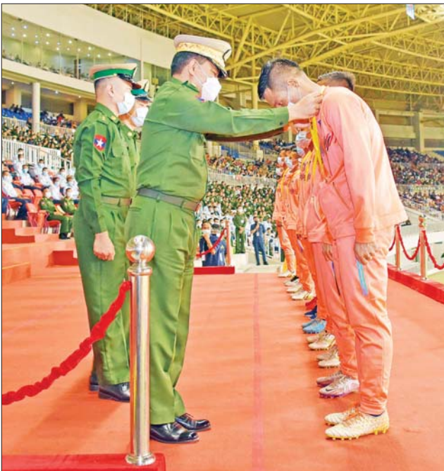
ညှိနှိုင်းကွပ်ကဲရေးမှူးကြီး (ကြည်း၊ ရေ၊ လေ) ဗိုလ်ချုပ်ကြီး မောင်မောင်အေး (က)အဆင့်ပြိုင်ပွဲတွင် ပထမဆုရရှိသည့် ရန်ကုန်တိုင်းစစ်ဌာနချုပ် ကိုယ်စားပြုအသင်းအား တစ်ဦးချင်းဆုတံဆိပ်များ ပေးအပ် ချီးမြှင့်စဉ်။

စစ်ဌာနချုပ် ကိုယ်စားပြုအသင်း က ဦးဆောင်ဂိုးကို လှပစွာ သွင်းယူရရှိခဲ့ပြီး အလယ်ပိုင်းတိုင်း စစ်ဌာနချုပ် ကိုယ်စားပြုအသင်း က ချေပဂိုးပြန်လည်ရရှိနိုင်ရေး အင်တိုက်အားတိုက် တိုက်စစ်ဆင် ကစားခဲ့သော်လည်း ဂိုးရရှိခဲ့ခြင်း မရှိသောကြောင့် ပွဲစဉ်ပြီးဆုံးချိန် တွင် ရန်ကုန်တိုင်းစစ်ဌာနချုပ် ကိုယ်စားပြုအသင်းက အလယ်ပိုင်း တိုင်းစစ်ဌာနချုပ် ကိုယ်စားပြု အသင်းကို တစ်ဂိုး - ဂိုးမရှိ ရလဒ် ဖြင့် အနိုင်ရရှိခဲ့သည်။ ယင်းနောက် တပ်မတော် (ကြည်း၊ ရေ၊ လေ) စစ်တီးပိုင်းအဖွဲ့ နှင့်အတူ စစ်ရေးပြမှုကြီး ဦးဆောင်၍ အလံတော်အဖွဲ့၊ အားကစားအသင်း ၁၇ သင်းနှင့် ဆုရဘောလုံးအသင်း မြောက်သင်း တို့မှ အားကစားသမားများက ဇေယျာသီရိ တပ်မတော် အားကစားကွင်းအတွင်း ဝင်ရောက် နေရာယူကြသည်။ ထို့နောက် ၂၀၂၂ ခုနှစ်၊ တပ်မတော် (ကြည်း၊ ရေ၊ လေ) အားကစားပြိုင်ပွဲ ဆုချီးမြှင့်ပွဲ စာမျက်နှာ ၄ သို့