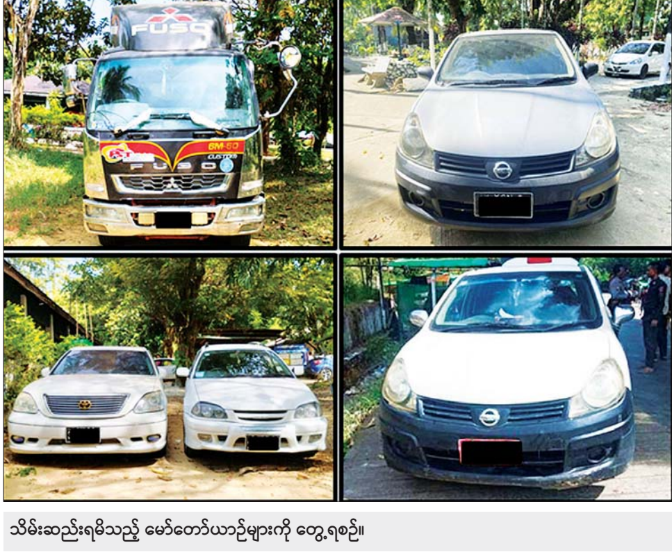
သိမ်းဆည်းရမိသည့် မော်တော်ယာဉ်များကို တွေ့ရစဉ်။