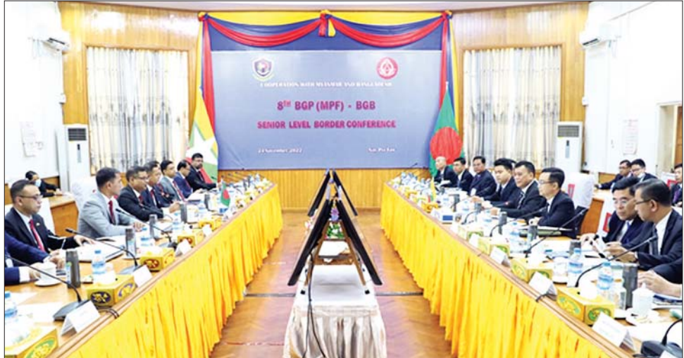
(၈) ကြိမ်မြောက် မြန်မာ-ဘင်္ဂလားဒေ့ရှ် နှစ်နိုင်ငံ နယ်ခြားစောင့်တပ်ဖွဲ့များ၏ အဆင့်မြင့်အရာရှိကြီးအဆင့် အစည်းအဝေးကျင်းပစဉ်။

(၈)ကြိမ်မြောက် မြန်မာ-ဘင်္ဂလားဒေ့ရှ် နှစ်နိုင်ငံ နယ်ခြားစောင့်တပ်ဖွဲ့များ၏ အဆင့်မြင့် အရာရှိကြီး များအဆင့်အစည်းအဝေးတွင် မြန်မာ-ဘင်္ဂလားဒေ့ရှ် နယ်စပ်ဒေသလုံခြုံရေးနှင့် တရားဥပဒေစိုးမိုးရေး အတွက် အချိန်နှင့်တစ်ပြေးညီ သတင်းဖလှယ်မှုများ ဆောင်ရွက်ရန် တပ်ရင်းမှူးအဆင့်၊ ဒေသကွပ်ကဲမှု အဆင့်နှင့် အဆင့်မြင့်အရာရှိကြီးများအဆင့် အစည်း အဝေးတို့ကို နှစ်ဖက်သဘောတူညီထားသည့်အတိုင်း လစဉ်၊ နှစ်စဉ် ကျင်းပပြုလုပ်ရန်၊ ဘင်္ဂလားဒေ့ရှ် ပိုင်နက်နယ်မြေကို အသုံးချ၍ အခြားနိုင်ငံအပေါ် ဆန့်ကျင်မည့် မည်သည့်အုပ်စုကိုမဆို ခွင့်ပြုသွား မည်မဟုတ်ဘဲ ရှာဖွေစုံစမ်းပိတ်ဆို့တားဆီးနှိမ်နင်းရန်၊ နယ်စပ်ဖြတ်ကျော်ရာဇဝတ်ရိုက်ဖျက်မှုများကို ကြိုတင် တားဆီးကာကွယ်သွားရန်၊ အကြမ်းဖက်သမားများ၏ ခြိမ်းခြောက်မှုသည် မူးယစ်ဆေးဝါးနှင့် တရားမဝင် နယ်စပ်ဖြတ်ကျော်ခိုးဝင်မှုများ ဖြစ်ပေါ်စေသဖြင့် တားဆီးနှိမ်နင်းရေးကို ထိရောက်စွာ ပူးပေါင်းဆောင် ရွက်ရန်၊ နှစ်နိုင်ငံ နယ်ခြားစောင့်တပ်ဖွဲ့များအကြား အောက်ခြေအဆင့်၊ အလယ်အလတ်အဆင့်နှင့် အဆင့်မြင့်အရာရှိကြီးအဆင့် ဆက်သွယ်မှုများ ပိုမိုလျှင်မြန်စွာ ဆောင်ရွက်ကြရန်၊ ယုံကြည်မှု တည်ဆောက်ခြင်း တိုးမြှင့်နိုင်ရေးအတွက် အပြန် အလှန်လည်ပတ်ခြင်း၊ အားကစားပြိုင်ပွဲများကျင်းပ ခြင်းနှင့် တွေ့ဆုံဆွေးနွေးမှုများ အခါအားလျော်စွာ ကျင်းပသွားရန်တို့ကို သဘောတူညီခဲ့ကြသည်။ အဆိုပါ ဆွေးနွေးသဘောတူညီမှုများကို ၂၀၂၂ ခုနှစ် ဒီဇင်ဘာလ တွင် စတင်အကောင်အထည်ဖော် ဆောင်ရွက်သွား ကြမည်ဖြစ်ကြောင်း သိရသည်။ သတင်းစဉ်