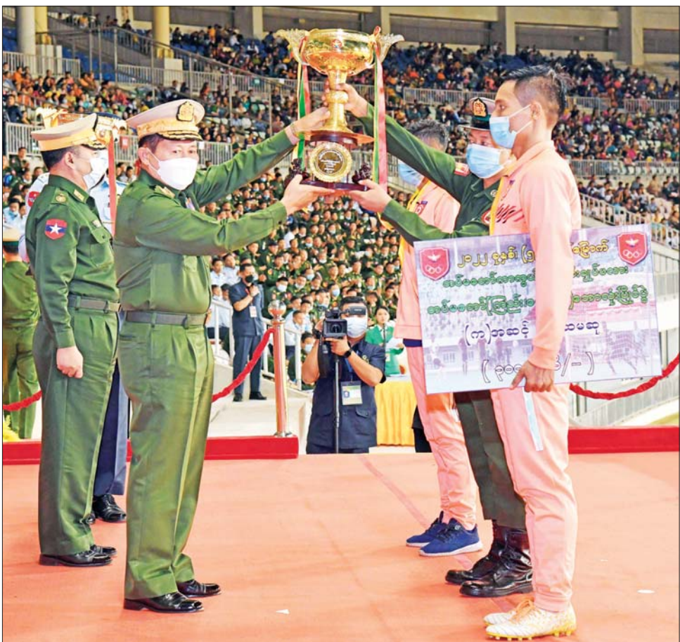
နိုင်ငံတော်စီမံအုပ်ချုပ်ရေးကောင်စီ ဒုတိယဥက္ကဋ္ဌ ဒုတိယတပ်မတော်ကာကွယ်ရေးဦးစီးချုပ် ကာကွယ်ရေးဦးစီးချုပ် (ကြည်း) ဒုတိယဗိုလ်ချုပ်မှူးကြီး စိုးမင်း (က) အဆင့် ပြိုင်ပွဲတွင် ပထမဆုရရှိသော ရန်ကုန်တိုင်းစစ်ဌာနချုပ် ကိုယ်စားပြုအသင်းအား တပ်မတော်ကာကွယ်ရေးဦးစီးချုပ်၏ ဆုဖလားပေးအပ်ချီးမြှင့်စဉ်။

ကာကွယ်ရေးဦးစီးချုပ် (လေ) ဗိုလ်ချုပ်ကြီး ထွန်းအောင်က (က)အဆင့် ပြိုင်ပွဲတွင် ဒုတိယဆု ရရှိသည့် အလယ်ပိုင်းတိုင်းစစ်ဌာနချုပ် ကိုယ်စားပြုအသင်းကိုလည်းကောင်း၊ ကာကွယ်ရေးဦးစီးချုပ် (ရေ) ဗိုလ်ချုပ်ကြီး မိုးအောင်က (ခ)အဆင့် ပြိုင်ပွဲတွင်