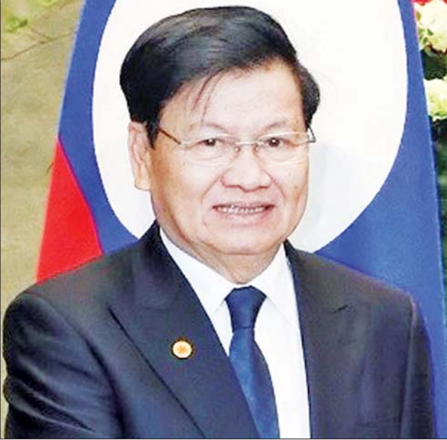
လာအိုသမ္မတ သောင်လွန်း ဆစ်စိုလစ်။