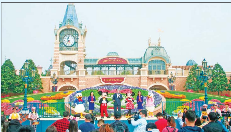
ရှန်ဟိုင်းဒစ္စနေလ်ဥယျာဉ်ကို တွေ့ရစဉ်။

ရှန်ဟိုင်း နိုဝင်ဘာ ၂၄ ရှန်ဟိုင်း ဒစ္စနေလ်ဥယျာဉ်ကို နိုဝင်ဘာ ၂၅ ရက်တွင် ပြန်လည်ဖွင့်လှစ်သွားတော့မည် ဖြစ်သည်။ ယခု သီတင်းပတ်အတွင်း တရုတ်နိုင်ငံ၏ ကိုဗစ်-၁၉ နေ့စဉ် ကူးစက်မှုနှုန်းမှာလည်း မြင့်မားလျက်ရှိသည်။ ကပ်ရောဂါ ထိန်းချုပ်ရေး စည်းကမ်းချက်များ အောက်တွင် တင်းကျပ်သည့် ကန့်သတ်မှုများနှင့်အတူ ရှန်ဟိုင်းဒစ္စနေလ် အပန်းဖြေဥယျာဉ်ကို ပြန်လည်ဖွင့်လှစ်မည်ဟု သိရသည်။ ရောဂါ ကူးစက်မှုများကို ကာကွယ်ရန်အတွက် ရှန်ဟိုင်းဒစ္စနေလ်ဥယျာဉ်ကို ပြီးခဲ့သည့် အောက်တိုဘာလမှ စတင်ကာ ပိတ်ထားခဲ့သည်။ လည်ပတ်သူများကို ဆွဲဆောင်နိုင်သည့် အချို့သောစွဲစွဲများ ယခုကာလတွင် ရရှိနိုင်ခြင်းမဟုတ်ချေ။ လာရောက် လည်ပတ်မည့် ဧည့်သည်များအားလုံး ၄၈ နာရီအတွင်း ဆေးစစ်ထားသည့် ကိုဗစ်-၁၉ ကင်းစင်ကြောင်း ဆေးလက်မှတ် ပါရှိရမည် ဖြစ်သည်။ တရုတ်နိုင်ငံ၌ နိုဝင်ဘာ ၂၃ ရက်က ကိုဗစ်-၁၉ ကူးစက်