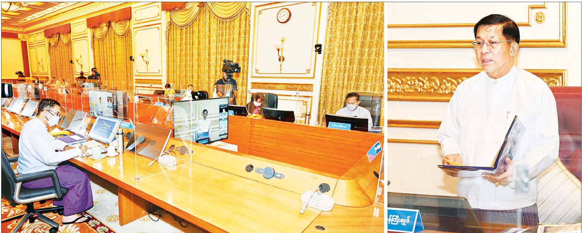
ဘဏ္ဍာရေးဆိုင်ရာကော်မရှင် ဥက္ကဋ္ဌ နိုင်ငံတော်စီမံအုပ်ချုပ်ရေးကောင်စီဥက္ကဋ္ဌ နိုင်ငံတော်ဝန်ကြီးချုပ် ဗိုလ်ချုပ်မှူးကြီး မင်းအောင်လှိုင် ဘဏ္ဍာရေးဆိုင်ရာကော်မရှင် အစည်းအဝေးအမှတ်စဉ် (၂/၂၀၂၂) တွင် အမှာစကားပြောကြားစဉ်။

၅။ အရေးပေါ်ကာလဆိုင်ရာ ပြဋ္ဌာန်းချက်များနှင့်အညီ ဆောင်ရွက်ပြီးစီးပါက ဖွဲ့စည်းပုံအခြေခံဥပဒေ (၂၀၀၈ ခုနှစ်) နှင့်အညီ လွတ်လပ်ပြီး တရားမျှတသော ပါတီစုံဒီမိုကရေစီ အထွေထွေရွေးကောက်ပွဲအား ပြန်လည်ကျင်းပ၍ အနိုင်ရသည့်ပါတီအား ဒီမိုကရေစီစံနှုန်းများနှင့်အညီ နိုင်ငံတော်တာဝန်အား လွှဲအပ်နိုင်ရေး ဆက်လက်ဆောင်ရွက်သွားမည်။