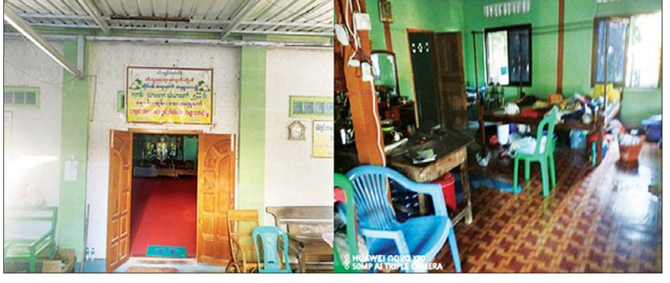
စစ်ကိုင်းမြို့နယ် ကင်းကျေးရွာရှိ ထိုင်ဝမ်ဘုန်းတော်ကြီးပညာရေးကျောင်းအား အကြမ်းဖက်သမားများက ဝင်ရောက်လုယက်ထားသည့် မှတ်တမ်းဓာတ်ပုံ။