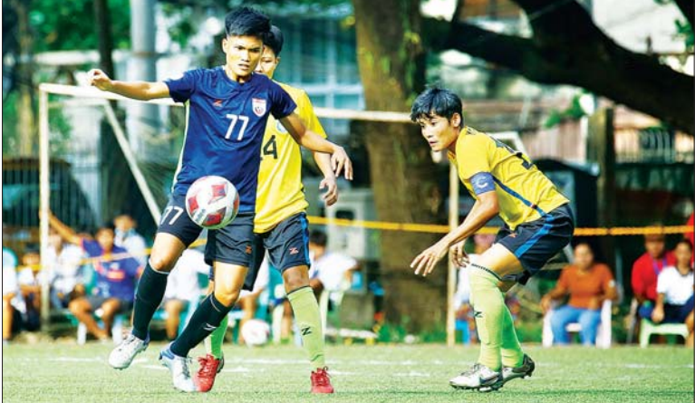
သစ္စာအားမာန်အသင်းနှင့် အား/ကာသိပွဲအသင်း ယှဉ်ပြိုင်စဉ်။

ရန်ကုန် နိုဝင်ဘာ ၂၄ ၂၀၂၂ ရာသီ မြန်မာအမျိုးသမီးလိဂ်ပြိုင်ပွဲ ပွဲစဉ် (၁၃) ကို နိုဝင်ဘာ ၂၃၊ ၂၄ ရက်က ဆက်လက်ကျင်းပရာ သစ္စာအားမာန်အသင်း၊ အား/ကာသိပွဲအသင်းနှင့် မြဝတီအသင်း အနိုင်ရရှိခဲ့သည်။ ပထမနေ့ ဗဟန်းမြက်ခင်းတုကွင်း၌ကျင်းပသည့်ပွဲတွင် သစ္စာအားမာန်အသင်းက အား/ကာသိပွဲအသင်းကို သုံးဂိုး-နှစ်ဂိုးဖြင့်အနိုင်ရခဲ့သဖြင့် ချန်ပီယံလွှဲလင့်ချက်ရှိလာပြီး နောက်ဆုံးပွဲတွင် အား/ကာသိပွဲအသင်း နိုင်ပွဲပျောက်ဆုံးပါက ချန်ပီယံဆုရယူနိုင်မည်ဖြစ်သည်။