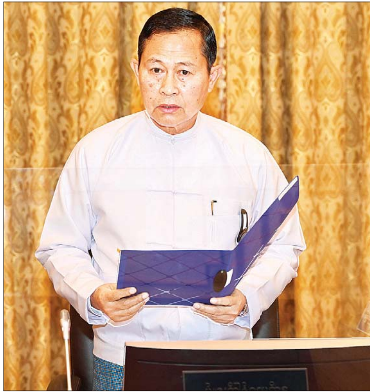
ဘဏ္ဍာရေးဆိုင်ရာကော်မရှင် ဒုတိယဥက္ကဋ္ဌ နိုင်ငံတော်စီမံအုပ်ချုပ်ရေးကောင်စီ ဒုတိယဥက္ကဋ္ဌ ဒုတိယဝန်ကြီးချုပ် ဒုတိယဗိုလ်ချုပ်မှူးကြီး စိုးဝင်း ရှင်းလင်းတင်ပြစဉ်။

ယင်းနောက် ဘဏ္ဍာရေးဆိုင်ရာ ကော်မရှင်အတွင်းရေးမှူး ပြည်ထောင်စုဝန်ကြီး ဦးဝင်းရှိန်က ၂၀၂၂-၂၀၂၃ ဘဏ္ဍာရေးနှစ် ဖြည့်စွက်ခွင့်ပြုငွေစာရင်း၊ ပြုပြင်ပြီး ခန့်မှန်းခြေငွေစာရင်းနှင့် ပြည်ထောင်စု၏