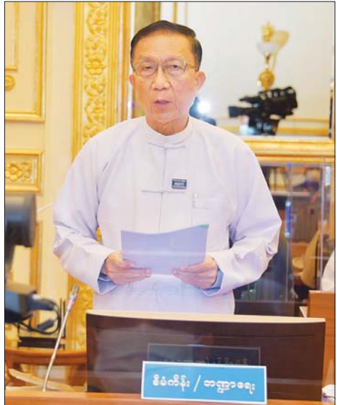
ပြည်ထောင်စုဝန်ကြီး ဦးဝင်းရှိန် ရှင်းလင်းတင်ပြစဉ်။