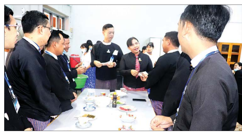
ရှေ့နေချုပ် ဒေါက်တာသိတာဦး နေ့လယ်စာ စားပွဲတွင် ပြည်ထောင်စုဝန်ကြီးနှင့် ပြည်ထောင်စုဝန်ကြီးဌာန၏ ရည်မှန်းချက်များအောင်မြင်စေရန် အဆင့်အလိုက် ပူးပေါင်းဆောင်ရွက်နေကြသည့် လုပ်ဖော်ကိုင်ဖက်များဖြစ်ကြောင်း၊

နေပြည်တော် နိုဝင်ဘာ ၂၄ နိုင်ငံတော်၏ အုပ်ချုပ်ရေးယန္တရားကောင်းမွန်အဆင်ပြေစွာ ဆောင်ရွက်နိုင်ရေးအတွက် ကျရာကဏ္ဍမှ တာဝန်သိ၊ သစ္စာရှိစွာဖြင့် ဆောင်ရွက်နေကြသော ဝန်ထမ်းများအား မိသားစုသဖွယ် နွေးနွေးထွေးထွေး ဆက်ဆံခြင်းနှင့် ဥပဒေရေးရာဝန်ကြီးဌာနအနေဖြင့် ဌာန၏ ဝန်ထမ်းများ စည်းလုံးညီညွတ်မှု ရှိသည်ကိုလည်း ဖော်ဆောင်လျက် ရှိကြောင်း ပြသသည့်အနေဖြင့် ဝန်ထမ်းများ၏ နေ့လယ်စာစားပွဲကို ယနေ့ နံနက်ပိုင်းတွင် ဥပဒေရေးရာဝန်ကြီးဌာန မြေညီထပ်အစည်းအဝေးခန်းမ၌ ကျင်းပ