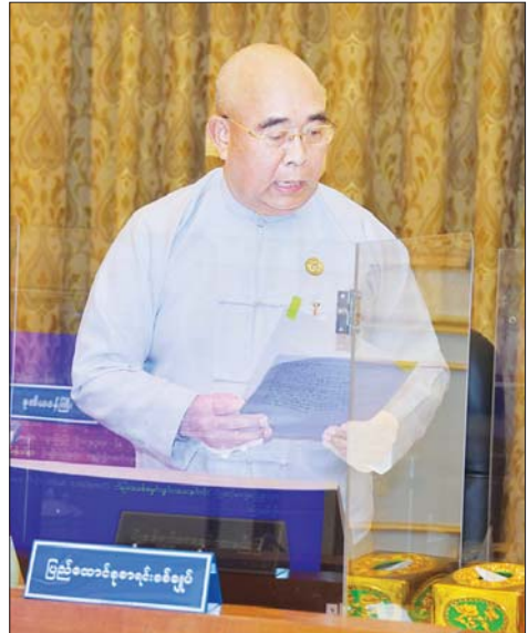
ပြည်ထောင်စုစာရင်းစစ်ချုပ် ဦးတင်ဦး ရှင်းလင်းတင်ပြစဉ်။

၂/၂၀၂၂ တွင် ၂၀၂၂-၂၀၂၃ ဘဏ္ဍာရေးနှစ်အတွက် ပြည်ထောင်စုနှင့် တိုင်းဒေသကြီး၊ ပြည်နယ်များ၏ ဖြည့်စွက်ခွင့်ပြု ငွေတောင်းခံမှုများကို အတည်ပြုပေးရန်နှင့် ၂၀၂၂-၂၀၂၃ ဘဏ္ဍာရေးနှစ် ပြည်ထောင်စု၏ နောက်ထပ်ဘဏ္ဍာငွေခွဲဝေသုံးစွဲရေး ဥပဒေကြမ်းကို ဘဏ္ဍာရေးဆိုင်ရာကော်မရှင်၏ အတည်ပြုထောက်ခံချက်နှင့် ပြည်ထောင်စုအစိုးရအဖွဲ့က တစ်ဆင့် နိုင်ငံတော်စီမံအုပ်ချုပ်ရေးကောင်စီကို ဆက်လက်ပေးပို့တင်ပြနိုင်ရေးအတွက် ဆွေးနွေးကြရန်ဖြစ်ကြောင်း။