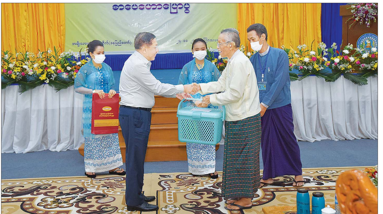
နိုင်ငံတော်စီမံအုပ်ချုပ်ရေးကောင်စီဥက္ကဋ္ဌ နိုင်ငံတော်ဝန်ကြီးချုပ် ဗိုလ်ချုပ်မှူးကြီး မင်းအောင်လှိုင် စာရေးဆရာကြီး တက္ကသိုလ် မြတ်သူအား ဂုဏ်ပြုလက်ဆောင်များ ပေးအပ်စဉ်။

နွယ်၊ ကောင်စီတွဲဖက်အတွင်းရေးမှူးနှင့် ဇနီး၊ ကောင်စီဝင်များနှင့် ဇနီးများ၊ ပြည်ထောင်စုဝန်ကြီးများ၊ ပြည်ထောင်စုအဆင့်ပုဂ္ဂိုလ်များနှင့် ဇနီးများ၊ နေပြည်တော်ကောင်စီဥက္ကဋ္ဌတပ်မတော်အရာရှိကြီးများနှင့် ဇနီးများ၊ နေပြည်တော်တိုင်းစစ်ဌာနချုပ် တိုင်းမှူးနှင့် ဇနီး၊ ဒုတိယဝန်ကြီးများ၊ စာပေပညာရှင်များနှင့် သာသနာရေးနှင့် ယဉ်ကျေးမှုဝန်ကြီးဌာနမှ ဝန်ထမ်းမိသားစုများ၊ ဖိတ်ကြားထားသူများ တက်ရောက်ကြသည်။