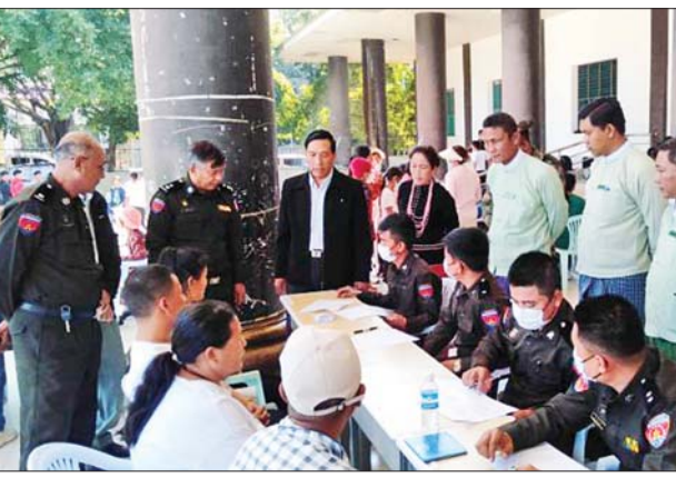
ယင်းနောက် “ဝ”ကိုယ်ပိုင်အုပ်ချုပ်ခွင့်ရတိုင်း စီမံအုပ်ချုပ်ရေးအဖွဲ့ ဥက္ကဋ္ဌနှင့် တာဝန်ရှိသူများသည် နှစ်တစ်မြို့ မြို့ပေါ် ရပ်ကွက်များမှ ပြည်သူများအား အိမ်ထောင်စုလူဦးရေစာရင်းနှင့် နိုင်ငံသားစိစစ်ရေးကတ်ပြားတို့ကို စတင်ဆောင်ရွက်ပေးခြင်းကို ကြည့်ရှုအားပေးကြကြောင်း သိရသည်။ (အပေါ်ပုံ) သတင်းစဉ်

ဟိုပန် နိုဝင်ဘာ ၂၂ “ဝ”ကိုယ်ပိုင်အုပ်ချုပ်ခွင့်ရတိုင်း ဟိုပန်ခရိုင် ဟိုပန်မြို့နယ် “ဝ”အထူးဒေသ(၂) နှစ်တစ်မြို့၌ ပန်းခင်းစီမံချက်အဆင့်(၂)ဖြင့် အိမ်ထောင်စုလူဦးရေစာရင်းနှင့် နိုင်ငံသားစိစစ်ရေးကတ်ပြားများ စတင်ကွင်းဆင်းဆောင်ရွက်ပေးခြင်းအခမ်းအနားကို ယနေ့ နံနက် ၉ နာရီတွင် နှစ်တစ်မြို့နယ်ခန်းမ၌ ကျင်းပသည်။