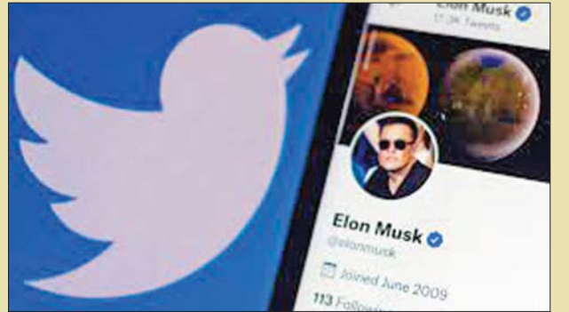
အီလွန်မက်ခ်ကို တွစ်တာကိုယ်စားပြု ငှက်ပုံစံသင်္ကေတနှင့်အတူ တွေ့ရစဉ်။

သည် တနင်္ဂနွေနေ့ နှောင်းပိုင်းက နောက်ဆုံးအလုပ်လုပ်ရသည့်နေ့ဟု ဆိုသည့် အသိပေးစာတစ်စောင် လက်ခံရရှိခဲ့ကြောင်း ခိုင်မာသည့် သတင်းရင်းမြစ်များကို ကိုးကားပြီး ဘလွန်းဘူဂျီက ဖော်ပြခဲ့သည်။ တွစ်တာကုမ္ပဏီတွင် မလိုအပ်တော့ပါဆိုပြီး မက်ဆေ့ချ်တွင် ဖော်ပြ ခဲ့သည်။ အီလွန်မက်ခ်က လွန်ခဲ့သောသီတင်းပတ်က ဝန်ထမ်းများကို စွမ်းအားမြှင့်ပြီး အလုပ်ချိန်အကြာကြီး ဆက်လုပ်မလား၊ သွားမလား ဆိုသည့် ရာဇသံပေးခဲ့သည်။ အင်န်အိတ်ချ်ကေ