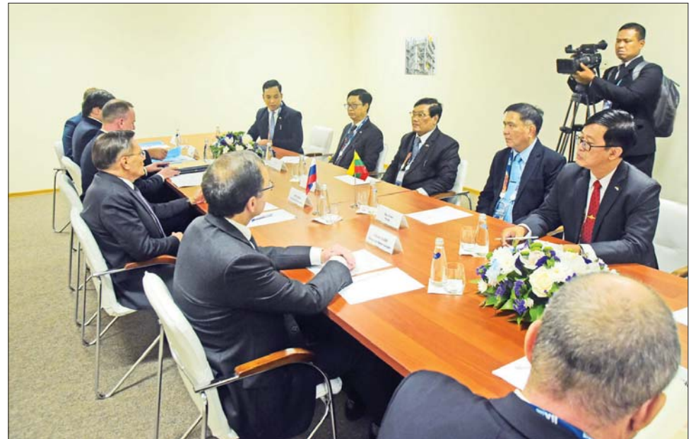
ပြည်ထောင်စုဝန်ကြီး ဦးသောင်းဟန်နှင့် ဒေါက်တာမျိုးသိန်းကျော်တို့ ဦးဆောင်သည့် မြန်မာကိုယ်စားလှယ် အဖွဲ့ Rosatom ၏ အကြီးအကဲဥက္ကဋ္ဌ အလက်ဆီလီကာချော့နှင့် တွေ့ဆုံဆွေးနွေးစဉ်။

တီထွင်မှုများကို ဆွေးနွေးခဲ့ကြပြီး Non Disclosure Agreement ကို လက်မှတ်ရေးထိုးကြသည်။ ATOMEXPO FORUM မှာ ၂၀၀၉ ခုနှစ်က စတင်ဆောင်ရွက် ခဲ့ပြီး နှစ်စဉ်ကျင်းပဆောင်ရွက်ခဲ့ သည့် နိုင်ငံတကာ နျူကလီးယား အဖွဲ့အစည်းများဖြစ်သော IAEA နှင့် ဥရောပ လက်တင်အမေရိက၊ အာရှနှင့် အာဖရိကနိုင်ငံအသီးသီး မှ အလေးထားတက်ရောက်သော Forum တစ်ခုဖြစ်သည်။ Nuclear Power မှ ကာဗွန်ဒိုင်အောက်ဆိုဒ် လျှော့ချရေးနှင့် Green Energy သို့ အသွင်ကူးပြောင်းရေး ရည်မှန်း ချက်အား အကောင်အထည်ဖော် ဆောင်ရွက်လျက်ရှိသည်။ ယခု Forum တွင် ဘီလာရစ်၊ ဇင်ဘာ ဘေ့၊ ဘူရန်ဒီ၊ မြန်မာ၊ ဥဘောက် ကစွတန် စသည့်နိုင်ငံများနှင့် လက်မှတ်ရေးထိုး ဆောင်ရွက် နိုင်ခဲ့ကြောင်း သိရသည်။ ဆွေးနွေး ပွဲတွင် Program ပေါင်း ၄၀ ကျော်၊ တက်ရောက်သူပေါင်း ၄၀၀၀ ကျော် တက်ရောက်ခဲ့ကြကြောင်း သိရသည်။ သတင်းစဉ်