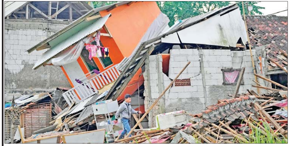
ပြင်းအား ၅ ဒဿမ ၆ အဆင့်ရှိသော ငလျင်ကြောင့် ထိုခိုက်ပျက်စီးမှုများကို တွေ့ရစဉ်။

ပေးခဲ့ကြောင်း၊ အိုးအိမ်နှင့် အခြေခံအဆောက်အအုံ ၂၁၀၀၀ ကျော် ထိုခိုက်ပျက်စီးမှု ဖြစ်ပွားခဲ့ ကြောင်းနှင့် ရှာဖွေကယ်ဆယ်ရေး လုပ်ငန်းများ ဆောင်ရွက်နေဆဲ ဖြစ်ကြောင်း ဆူဟာရန်တိုက ပြောသည်။ နိုဝင်ဘာ ၂၂ ရက် အစောပိုင်း တွင် ငလျင်ဒဏ်သင့်ဒေသများသို့ သွားရောက်ကာ ထိုခိုက်ဒဏ်ရာ ရရှိသူများကို ဦးစားပေး ကယ်ဆယ်မှုပြုလုပ်ရန် အာဏာ ပိုင်များကို အင်ဒိုနီးရှားသမ္မတ ဂျိုကိုဝီဒိုဒိုက တောင်းဆိုထား သည်။ ထို့အပြင် ငလျင်ကြောင့် ပျက်စီးသွားသည့် အိုးအိမ်များ အတွက် အင်ဒိုနီးရှား ရူပီယာ ၁၀ သန်းမှ သန်း ၅၀ အထိ အစိုးရ အနေဖြင့် လျော်ကြေးပေးသွား မည်ဖြစ်ကြောင်းနှင့် ဆောက် လုပ်မည့် အိမ်အသစ်များသည် ငလျင်ဒဏ်ခံနိုင်ရည် ရှိရမည် ဖြစ်ကြောင်း သမ္မတ ဂျိုကိုဝီဒိုဒို က ပြောသည်။ အဆိုပါငလျင်သည်အနောက် ဂျာဗားပြည်နယ် စီအန်ဂျာခရိုင် ၏ အနောက်တောင်ဘက် ၁၀ ကီလိုမီတာအကွာကို ဗဟိုပြု၍ နိုဝင်ဘာ ၂၁ ရက်က ဒေသစံတော် ချိန် မွန်းလွဲ ၁ နာရီ ၂၁ မိနစ်တွင် လှုပ်ခတ်ခဲ့ခြင်းဖြစ်ကြောင်း သိရ သည်။ ဆင်ဟွာ