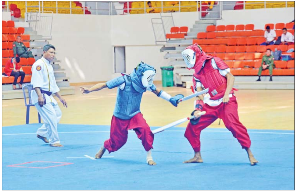
တပ်မတော်(ကြည်း၊ ရေ၊ လေ) အားကစားပြိုင်ပွဲအဖြစ် ဓားတစ်လက်အတိုက်ပြိုင်ပွဲ ယှဉ်ပြိုင်စဉ်။