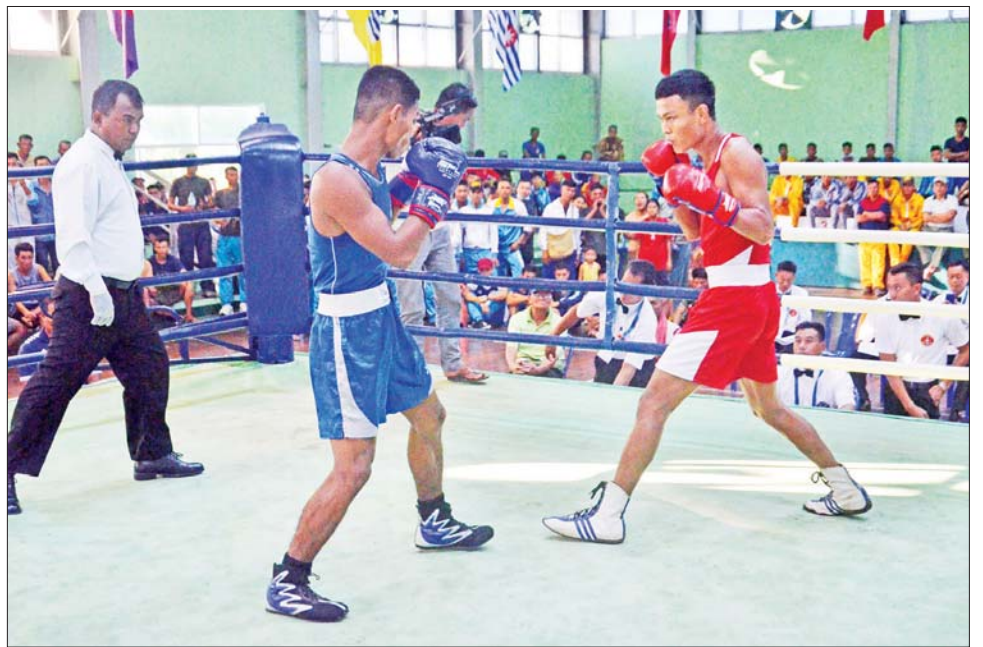
တပ်မတော်(ကြည်း၊ ရေ၊ လေ) အားကစားပြိုင်ပွဲအဖြစ် လက်ဝှေ့ပြိုင်ပွဲ ယှဉ်ပြိုင်စဉ်။