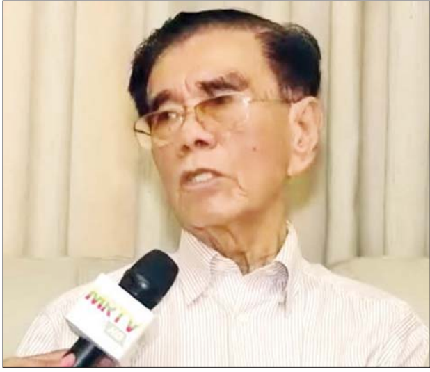
ဒေါက်တာချစ်၊ စာပေထူးချွန်တံဆိပ်(ဒုတိယဆင့်)