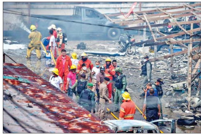
ကားပုံးပေါက်ကွဲခဲ့သည့်နေရာကို တွေ့ရစဉ်။