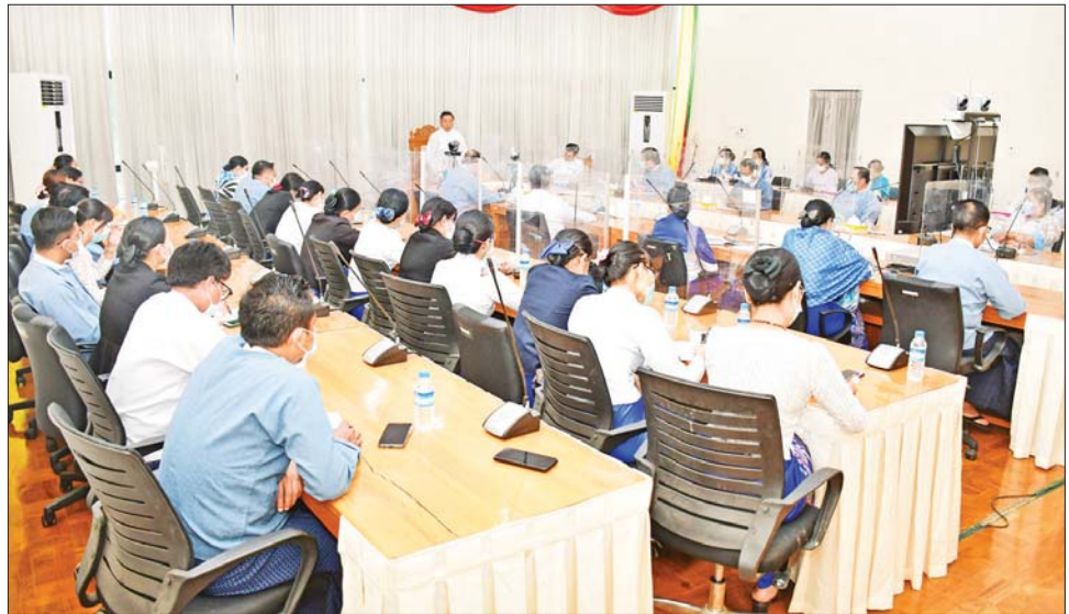
လိုအပ်ကြောင်း ပြောကြားသည်။

ထို့နောက် ဒုတိယဝန်ကြီး ဦးဇော်အေးမောင်က ၂၀၀၈ ဖွဲ့စည်းပုံအခြေခံဥပဒေ၊ တိုင်းရင်းသား အခွင့်အရေးများ ကာကွယ်စောင့်ရှောက်သည့်ဥပဒေ၊ နည်းဥပဒေ၊ နိုင်ငံ့ဝန်ထမ်းဥပဒေ၊ နည်းဥပဒေများ ကို သေချာစွာလေ့လာထားကြရမည် ဖြစ်ကြောင်း၊ တိုင်းဒေသကြီးနှင့် ပြည်နယ်များရှိ ဥပဒေများ၊ မြေယာဥပဒေများကို သေချာစွာသိရှိထားကြရန်