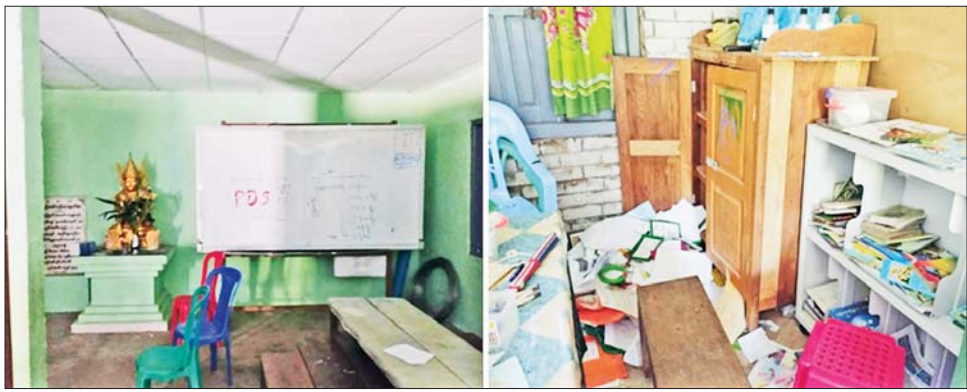
တောင်ငူမြို့နယ်၌ PDF အမည်ခံအကြမ်းဖက်သမားများက အခြေခံပညာမူလတန်းကျောင်းရှိ ပစ္စည်းများအား ဝင်ရောက်ဖျက်ဆီးမှု။

နိုင်ငံတော်အစိုးရအနေဖြင့် နိုင်ငံ၏အနာဂတ်ဖြစ်သည့် မျိုးဆက်သစ် ရင်ဆိုင်သည့် ပညာရေးတွင် နောက်ကျကျန်ရစ်မှုမဖြစ်ပေါ်စေရေးအတွက် ပညာသင်ကြားနိုင်မှု အခွင့်အလမ်းကို ပြည့်စုံစွာအသုံးပြုနိုင်စေရန် အခြေခံပညာကျောင်းများကို ဇွန် ၂ ရက်တွင် စတင်ဖွင့်လှစ်သင်ကြားပေးခဲ့ပြီး ကျောင်းဝတ်စုံ၊ ကျောင်းသုံး ဖတ်စာအုပ် အပါအဝင် ကျောင်းသုံးစာရေးကိရိယာများကို နိုင်ငံတော်အစိုးရမှ အခမဲ့ထောက်ပံ့ပေးခြင်း၊ ကိုဗစ်-၁၉ ရောဂါ ကာကွယ်ဆေးထိုးနှံပေးခြင်းတို့ကို အင်တိုက်အားတိုက် အကောင်အထည်ဖော် ဆောင်ရွက်လျက်ရှိပါသည်။