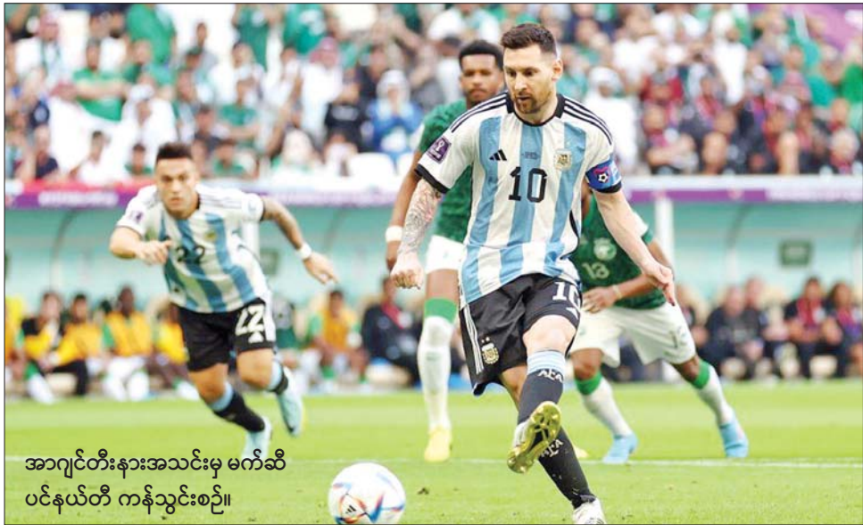
အာဂျင်တီးနားအသင်းမှ မက်ဆီ ပင်နယ်တီ ကန်သွင်းစဉ်။

ကမ္ဘာ့ဖလားပြိုင်ပွဲ အုပ်စု (ဂ) ပွဲစဉ် (၁) မှ နာမည်ကြီး အာဂျင်တီးနားနှင့် ဆော်ဒီအာရေဗျအသင်းတို့ ပွဲစဉ်ကို နိုဝင်ဘာ ၂၂ ရက် ညပိုင်း က လူဆေးလ်အိုင်ကွန်းနစ် အားကစားကွင်း၌ ယှဉ်ပြိုင်ကစားခဲ့ရာ ဆော်ဒီအာရေဗျအသင်းက နှစ်ဂိုး - တစ်ဂိုးဖြင့် အနိုင်ရရှိခဲ့သည်။ အာဂျင်တီးနား အသင်းတွင် မက်ဆီ၊ ဒီမာရီယာ စသည့် ထိပ်တန်းကစားသမား အမြောက်အမြား ပါဝင်လာသော်လည်း စာမျက်နှာ ၁၈ ကော်လံ ၅ ၀