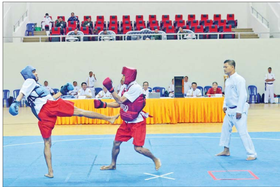
တပ်မတော် (ကြည်း၊ ရေ၊ လေ) အားကစားပြိုင်ပွဲအဖြစ် မြန်မာ့သိုင်းပြိုင်ပွဲ ယှဉ်ပြိုင်ကစားစဉ်။