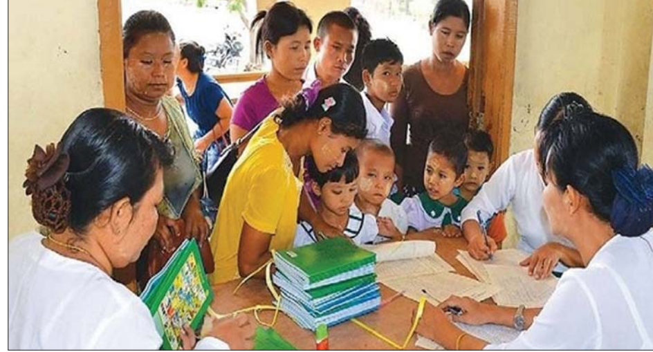
မြန်မာနိုင်ငံ၏ မသင်မနေရ ပညာရေးစနစ်အရ အခမဲ့ ကျောင်းအပ်နှံနေသော မူလတန်း ကျောင်းသား ကျောင်းသူလေးများ။

ဖိုးသုညတွေနှင့် နိုင်ငံတည်ဆောက်၍မရနိုင် ပါလီမန် ဒီမိုကရေစီအစိုးရ လက်ထက်တွင် ဝန်ကြီးချုပ်တာဝန်ယူခဲ့သည့် ဦးနု၏ လူ့စွမ်းအား အရင်းအမြစ်နှင့် ပတ်သက်သည့် ထင်ရှားသည့် စကားမှာ “ဖိုးသုညတွေနှင့် နိုင်ငံတည်ဆောက်၍ မရနိုင်” ဟူ၍ ဖြစ်ပါသည်။ ကိုလိုနီဆိုးမွေနှင့် ဒုတိယကမ္ဘာစစ်ဒဏ်ကြောင့် စာမတတ်သူ ၆၅