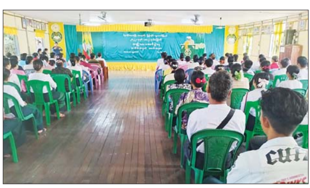
ကိုကိုမင်း(ပြန်/ဆက်)

ဆက်လက်၍ မြို့နယ်အားကစားကွင်းအတွင်း၌ အခြေခံပညာ ကျောင်းသားကျောင်းသူများ၏ ပြေးခုန်ပစ်ပြိုင်ပွဲများ၊ ဂုဏ်နိမိတ်စွပ် ပြိုင်ပွဲနှင့် အခြေခံပညာကျောင်းသားများ (အလွတ်တန်း) ပိုက်ကျော် ခြင်းပြိုင်ပွဲများကို စည်ကားသိုက်မြိုက်စွာ ကျင်းပပြီး ဆုရရှိသူများ ကို တာဝန်ရှိသူများက ဆုများ ပေးအပ်ချီးမြှင့်ကြောင်း သိရသည်။