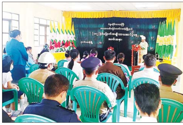
မြို့နယ်(ပြန်/ဆက်)

အခမ်းအနားသို့ မြို့နယ်စီမံအုပ်ချုပ်ရေးအဖွဲ့ဥက္ကဋ္ဌနှင့် အဖွဲ့ဝင် များ၊ မြို့နယ်မီးသတ်တပ်ဖွဲ့ဝင်များ၊ ကြက်ခြေနီတပ်ဖွဲ့ဝင်များ၊ မြို့နယ်အမျိုးသမီးရေးရာ ကော်မတီဝင်များ၊ မိခင်နှင့် ကလေး စောင့်ရှောက်ရေးအဖွဲ့ဝင်များ၊ ဌာနဆိုင်ရာများ၊ လူမှုရေးအသင်းအဖွဲ့ များ၊ မြို့နယ်ပညာရေးမှူးနှင့် ဆရာ ဆရာမများ၊ ကျောင်းသား ကျောင်းသူများ ပြည်သူများ စုစုပေါင်း ၂၃၅ ဦး တက်ရောက်ရာ ပြန်ကြားရေးနှင့် ပြည်သူ့ဆက်ဆံရေးဦးစီးဌာနမှ (၁၀၂) နှစ်မြောက် အမျိုးသားအောင်ပွဲနေ့အထိမ်းအမှတ် “သတင်းစကား” လက်ကမ်း စာစောင်များ ဖြန့်ဝေကြောင်း သိရသည်။