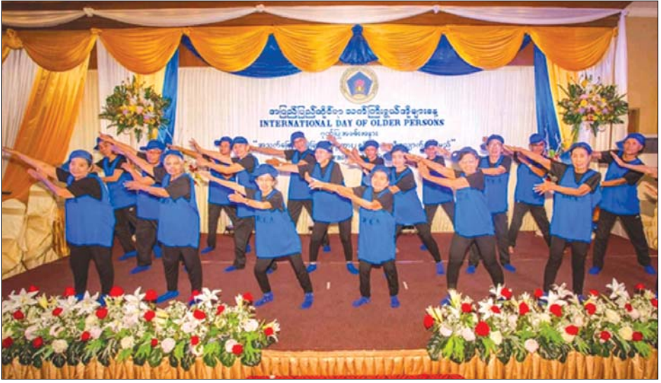
အပြည်ပြည်ဆိုင်ရာ သက်ကြီးရွယ်အိုများနေ့ အခမ်းအနားတွင် ပါဝင်ဆင်နွှဲနေသော ဘိုးဘွားများ။

မြန်မာနိုင်ငံ၏ သက်ကြီးရွယ်အို အချိုးအစား သည်လည်း ယခင်ကထက် ပိုမိုများပြားလျက်ရှိရာ အသက် ၆၀ နှင့်အထက် သက်ကြီးရွယ်အို ရာခိုင်နှုန်းသည် ၁၉၇၃ ခုနှစ်တွင် ၆ ရာခိုင်နှုန်းသာရှိရာမှ ၂၀၁၉ ခုနှစ်တွင် ၁၀ ဒသမ ၁ ရာခိုင်နှုန်းအထိ တိုးတက်ပြောင်းလဲလာသည်။ ပြည်သူ့အင်အားဦးစီးဌာနက ထုတ်ပြန်ထားသော သက်ကြီးရွယ်အို အကြောင်းအရာ သုတေသနစာတမ်းအရ မြန်မာနိုင်ငံ၌ သက်ကြီးရွယ်အိုဦးရေ ၄ ဒသမ ၅ သန်းခန့် ရှိပြီး ၂၀၅၀ ပြည့်နှစ်တွင် သက်ကြီးရွယ်အို ၁၃ သန်းခန့် ရှိလာနိုင်သည်ဖြစ်ရာ သက်ကြီးရွယ်အို အရေအတွက်နှင့် အသက် ၁၅ နှစ်အောက် ကလေး အရေအတွက် တူညီလှနီးပါး ဖြစ်လာတော့မည်။