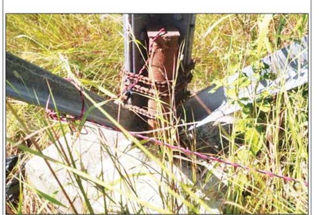
၂၃၀ ကေဗီ မင်းဘူး (မန်း) - အမ်း ဓာတ်အားလိုင်း တာဝါတိုင်အမှတ် (၉၄) ရှိ အောက်ခြေထောက်တိုင်တစ်ခု ဖောက်ခွဲဖျက်ဆီးခံရမှု အထောက်အထားများအား တွေ့ရှိရစဉ်။