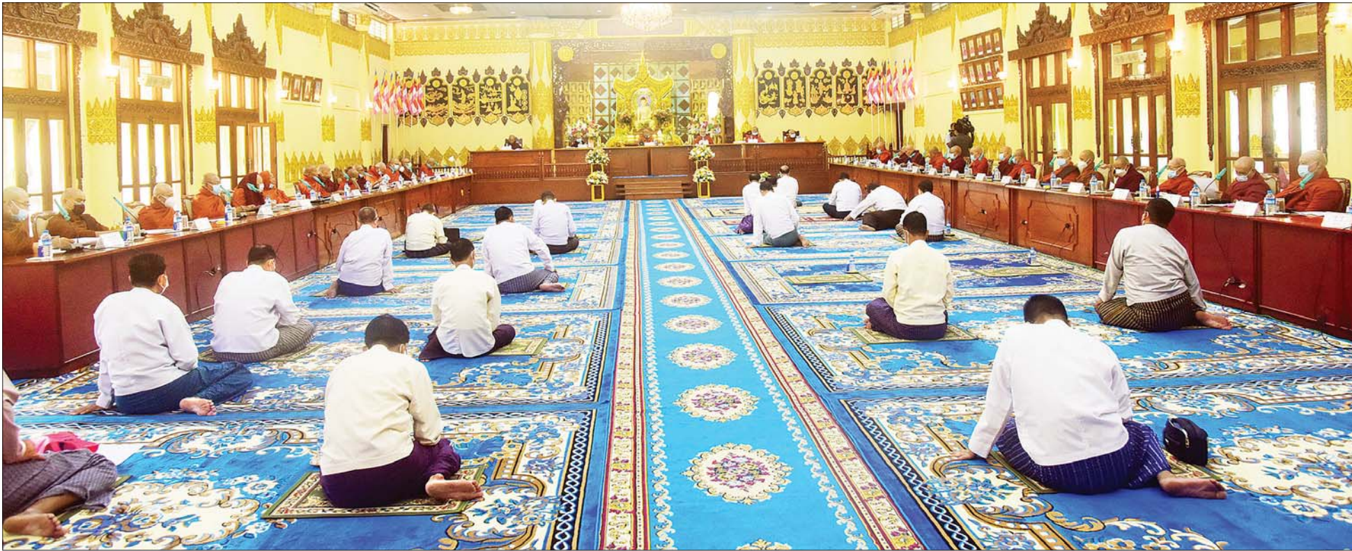
အဋ္ဌမအကြိမ် နိုင်ငံတော်သံဃမဟာနာယကအဖွဲ့ ၄၇ ပါးစုံညီ ဒွါဒသမအစည်းအဝေး ဒုတိယနေ့ ကျင်းပစဉ်။

၄။ တစ်နိုင်ငံလုံး ထာဝရငြိမ်းချမ်းရေးရရှိရေးအတွက် တစ်နိုင်ငံလုံး ပစ်ခတ်တိုက်ခိုက်မှု ရပ်စဲရေးသဘောတူစာချုပ် (NCA) ပါ သဘောတူညီချက်များအတိုင်း ဖြစ်နိုင်သမျှ အလေးထား လုပ်ဆောင်သွားမည်။ ၅။ အရေးပေါ်ကာလဆိုင်ရာ ပြဋ္ဌာန်းချက်များနှင့်အညီ ဆောင်ရွက်ပြီးစီးပါက ဖွဲ့စည်းပုံအခြေခံဥပဒေ (၂၀၀၈ ခုနှစ်) နှင့်အညီ လွတ်လပ်ပြီး တရားမျှတသော ပါတီစုံဒီမိုကရေစီ အထွေထွေရွေးကောက်ပွဲအား ပြန်လည်ကျင်းပ၍ အနိုင်ရသည့်ပါတီအား ဒီမိုကရေစီစံနှုန်းများနှင့်အညီ နိုင်ငံတော်တာဝန်အား လွှဲအပ်နိုင်ရေး ဆက်လက်ဆောင်ရွက်သွားမည်။