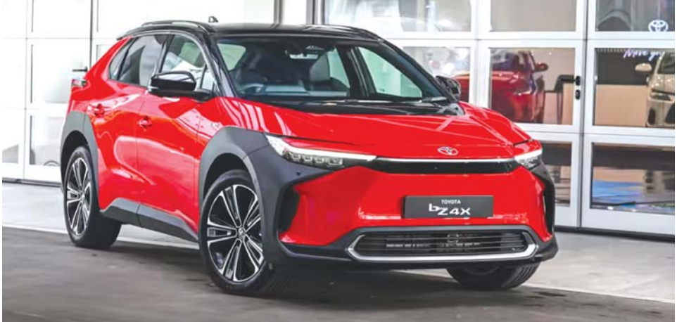
ထိုင်းနိုင်ငံအတွင်း ပထမဆုံးရောင်းချမည့် တိုယိုတာလျှပ်စစ်ကား မော်ဒယ် bZ4X ။ ထိုင်းဘတ်ငွေ ၁ ဒသမ ၈၃ သန်း လျှပ်စစ်ကားကို တစ်ကြိမ် အရောင်ခြောက်မျိုးဖြင့် ထုတ်လုပ် (အမေရိကန်ဒေါ်လာ ၄၉၉၀၀) အားသွင်းပြီးပါက ကီလိုမီတာ ရောင်းချသွားမည် ဖြစ်ကြောင်း သတ်မှတ်ထားကြောင်း သိရသည်။ ၄၀၀ အထိ မောင်းနှင်သွားလာနိုင်ပြီး သိရသည်။

ဂျပန်နိုင်ငံအခြေစိုက် တိုယိုတာ ကုမ္ပဏီသည် ထိုင်းနိုင်ငံ၏ လျှပ်စစ်ကားဈေးကွက်အတွင်းသို့ ထိုးဖောက် ဝင်ရောက်နိုင်ရန် ကြိုးပမ်းလျက်ရှိပြီး မကြာမီ ထိုင်းနိုင်ငံ၌ လျှပ်စစ်ကားများကို စတင် ရောင်းချတော့မည်ဖြစ် ကြောင်း ကြေညာထားသည်။ ထိုင်းနိုင်ငံ၌ မိတ်ဆက် ရောင်းချမည့် လျှပ်စစ်ကားမှာ bZ4X ဖြစ်ပြီး တိုယိုတာ၏ နာမည်ကျော် Lexus ဇိမ်ခံကား ပြီးပါက ပထမဆုံးထုတ်လုပ်သည့် လျှပ်စစ်ကားလည်း ဖြစ်သည်။ ဂျပန်၌ပင် ထုတ်လုပ်သွားမည် ဖြစ်ပြီး အဆိုပါလျှပ်စစ်ကားကို