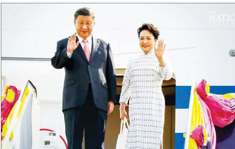
တရုတ်သမ္မတရှီကျင့်ဖျင်နှင့် ထိုင်း၏ဇနီး ပန်လီယွမ်။

ဘန်ကောက်၊ နိုဝင်ဘာ ၁၇ တရုတ်သမ္မတ ရှီကျင့်ဖျင်သည် (၂၉) ကြိမ်မြောက် အာရှ-ပစိဖိတ်စီးပွားရေး ပူးပေါင်းဆောင်ရွက်မှု (APEC) စီးပွားရေးခေါင်းဆောင်များ အစည်းအဝေးသို့ တက်ရောက်ရန် နိုဝင်ဘာ ၁၇ ရက်တွင် ထိုင်းနိုင်ငံသို့ အလည်အပတ်ရောက်ရှိနေကြောင်း ဆင်ပွာက ဖော်ပြသည်။