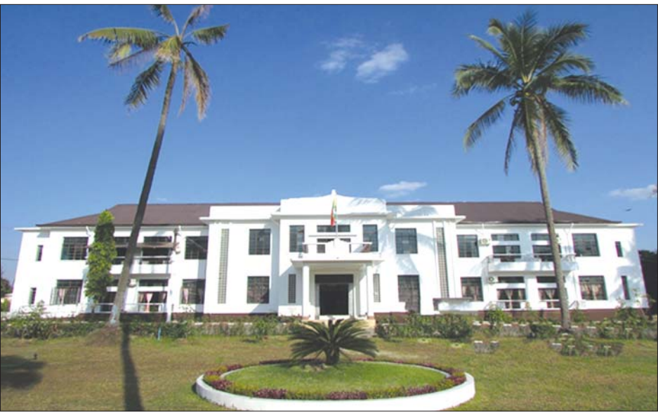
မရမ်းကုန်းမြို့နယ်ရှိ သက်ကြီးရွယ်အိုများ နေပိုင်းစောင့်ရှောက်ရေး ဂေဟာ။

ဘက်စုံ၊ ထောင့်စုံမှ ဝန်ဆောင်မှုပြုပေးနေ ထို့အတူ စာဖတ်ခြင်း၊ ကွန်ပျူတာအင်တာနက် အသုံးပြုခြင်း၊ ရုပ်သံလိုင်းများကြည့်ရှုခြင်း၊ ကာရာ အိုကေသီဆိုခြင်း၊ တရားထိုင်ခြင်း၊ ဆွေးနွေးခြင်း၊ ဟောပြောခြင်း၊ မိမိဝါသနာပါရာများ လုပ်ဆောင် ခြင်း စသည့် “အပန်းဖြေအနားယူမှုဆိုင်ရာ ဝန်ဆောင် မှု” များကို နေ့စဉ်ပြုလုပ်ပေးလျက်ရှိသည်။ ထိုမျှ မက အာဟာရပြည့်ဝသော နံနက်စာ၊ နေ့လယ်စာ၊ မွန်းလွဲစာ သုံးကြိမ်ကို နေ့စဉ်ကျွေးမွေးခြင်း၊ သက်ကြီးသူများ သိသင့်သိအပ်သော ကျန်းမာရေး၊ လူမှုရေးနှင့် သဘာဝဘေးအန္တရာယ်ဆိုင်ရာ ဗဟုသုတများနှင့် အခြားဘာသာရပ်များကို အခါ အားလျော်စွာ ဟောပြောဆွေးနွေးခြင်းဖြင့် ဘက်စုံ၊ ထောင့်စုံမှ ဝန်ဆောင်မှုပြုပေးနေသည်ဟု သိရ သည်။