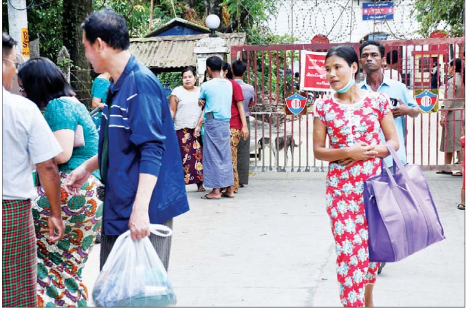
စစ်တွေအကျဉ်းထောင်မှ လွတ်မြောက်လာသည့် အကျဉ်းသား အကျဉ်းသူများကို တွေ့ရစဉ်။

တွင် စစ်တွေအကျဉ်းထောင်မှ အကျဉ်းသား ၆၂ ဦး၊ အကျဉ်းသူ ကိုးဦး၊ ကျောက်ဖြူအကျဉ်းထောင်မှ အကျဉ်းသား ၃၀၊ အကျဉ်းသူ တစ်ဦး၊ ဘူးသီးတောင်အကျဉ်းထောင်မှ အကျဉ်းသား ၁၆ ဦးနှင့် သံတွဲအကျဉ်းထောင်မှ အကျဉ်းသား ၇၄ ဦး၊ အကျဉ်းသူနှစ်ဦး စုစုပေါင်း အကျဉ်းသား၊ အကျဉ်းသူ ၁၉၄ ဦးလွတ်မြောက်ခဲ့ကြောင်း သိရသည်။ အဆိုပါ လွတ်မြောက်လာသူများအား မိသားစုဝင်များ၊ သူငယ်ချင်းနှင့် မိတ်ဆွေများက ရင်းနှီးပျော်ရွှင်စွာ ကြိုဆိုကြကြောင်း သိရသည်။ သတင်းနှင့် ဓာတ်ပုံ - တင်ထွန်း(ပြန်/ဆက်)