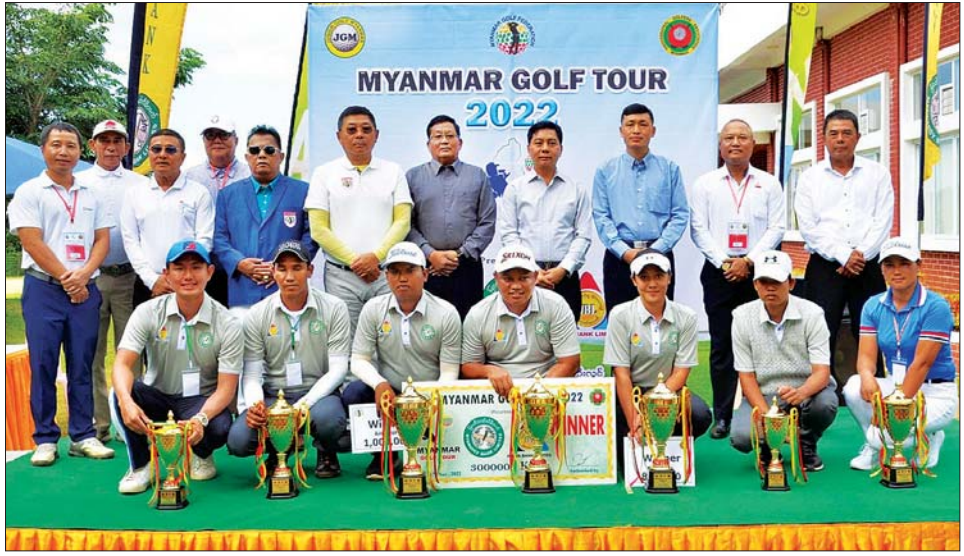
သစ်ပင်စိုက်မှ အရိပ်ရ၏။ ရိပ်ခိုနားနေ အပန်းပြေ၏။