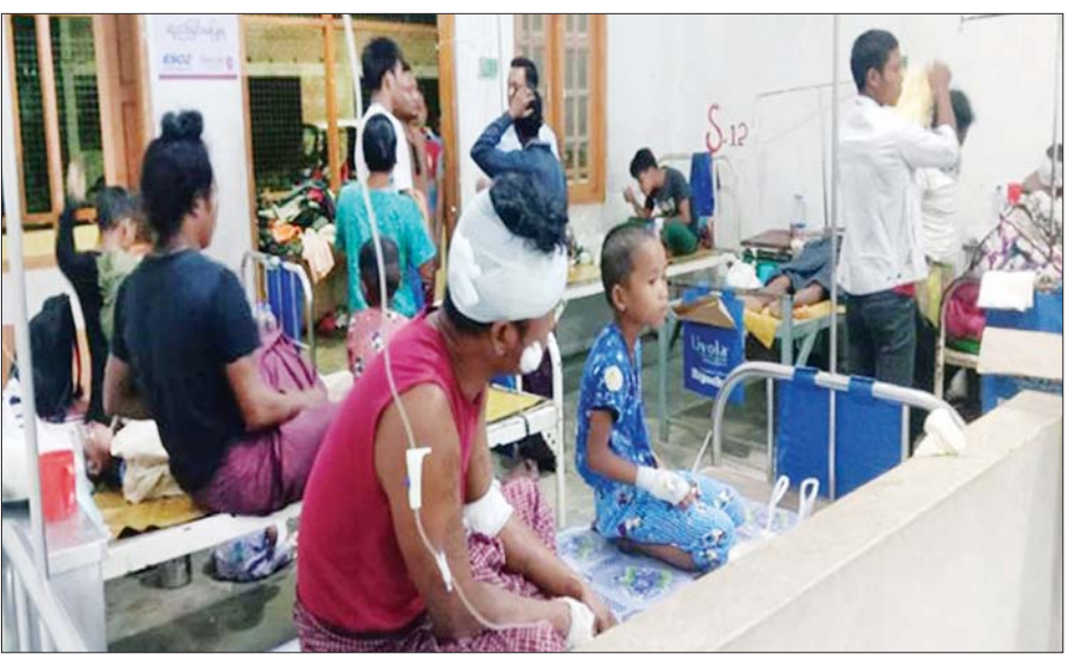
လောင်းခုံ(မြို့)ကျေးရွာအတွင်း AA အဖွဲ့များ ပစ်ခတ်သည့် ၆၀ မမဗုံးသီး သုံးလုံး ကျရောက် ပေါက်ကွဲမှုကြောင့် ဒဏ်ရာရရှိသည့် ကျေးရွာသူကျေးရွာသားများ။

ပေါင်း ၁၀ ဦးသေဆုံးခဲ့ပြီး အသက် ၃ နှစ်အရွယ် ကလေးငယ်တစ်ဦး၊ အသက် ၄ နှစ်အရွယ် ကလေးငယ် သုံးဦး အသက် ၅ နှစ်အရွယ် ကလေးငယ်သုံးဦးတို့ အပါအဝင် အမျိုးသား ၂၁ ဦး၊ အမျိုးသမီး သုံးဦး စုစုပေါင်း ၂၄ ဦးတို့တွင် လက်နက်ကြီးအစ ထိခိုက်ဒဏ်ရာ များ အသီးသီးရရှိခဲ့သည်။ အဆိုပါဖြစ်စဉ်တွင် ထိခိုက် ဒဏ်ရာရရှိခဲ့သည့် အပြစ်မဲ့ဒေသခံ တိုင်းရင်းသား ပြည်သူများကို တာဝန်ရှိသူများက သွားရောက် ကြည့်ရှုအားပေး၍ မောင်တောမြို့ ပြည်သူ့ဆေးရုံသို့ သွားရောက် ဆေးကုသနိုင်ရေး လိုအပ်သည် များ ညှိနှိုင်းဖြည့်ဆည်းဆောင်ရွက် ခဲ့ပြီး ထောက်ပံ့ငွေများ၊ ဆန်၊ ဆီနှင့် စားသောက်ဖွယ်ရာများ ထောက်ပံ့ ပေးအပ်ခဲ့ကြောင်းနှင့်