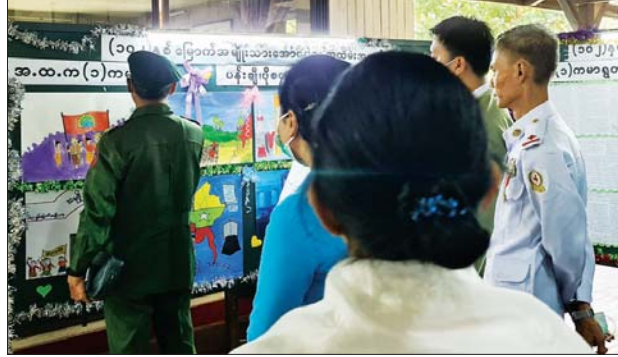
စန္ဒာမိုး

အခမ်းအနားသို့ အင်းစိန်မြို့နယ်စီမံအုပ်ချုပ်ရေးအဖွဲ့ဥက္ကဋ္ဌနှင့် အဖွဲ့ဝင်များ၊ မြို့နယ်အဆင့်ဌာနဆိုင်ရာများမှ တာဝန်ရှိသူများ၊ မြို့နယ် အထက်တန်း၊ အလယ်တန်း၊ မူလတန်း ကျောင်းအုပ်ကြီးများနှင့် တာဝန်ရှိသူများ တက်ရောက်ကြကြောင်း သိရသည်။