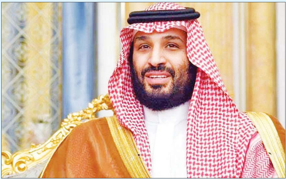
ဆော်ဒီအိမ်ရှေ့မင်းသား မိုဟာမက်ဘင်ဆယ်မန်။

၂၀၁၈ ခုနှစ် သတင်းထောက် အသတ်ခံရမှုတွင် ဆော်ဒီအိမ်ရှေ့မင်းသားပါဝင်သည်ဟူသော စွပ်စွဲချက်ဖြင့် ဆော်ဒီအိမ်ရှေ့မင်းသားကို အနောက်နိုင်ငံများနှင့် အခြားသောတိုင်းပြည်များက အပြစ်တင်ထားကြသည်။ သို့သော်လည်း နိုင်ငံတကာ စင်မြင့်တွင် ၎င်း၏ပါဝင်မှု ပြန်လည်ပြုလုပ်လာခဲ့သည်။ အနောက်အုပ်စုခေါင်းဆောင်များကလည်း ရေနံဈေးနှုန်း တည်ငြိမ်စေရန် ကြိုးပမ်းမှုတစ်ရပ်အဖြစ် ဆော်ဒီအိမ်ရှေ့မင်းသားနှင့် ဆွေးနွေးမှုများ ပြန်လည်လုပ်ဆောင်လာခဲ့သည်။ အင်အိတ်ချီကေ