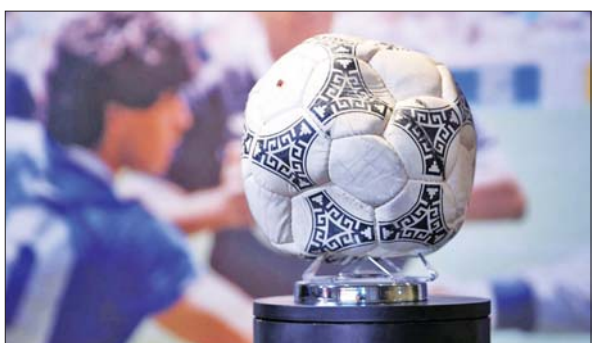
မာရာဒိုနာ၏ ဘုရားပေးသောလက်ဟု အမည်ရသည့်ဘောလုံး။

ဘုရားပေးသောလက်ဆိုသည်မှာ အဆိုပါပွဲစဉ်တွင် ဦးဆောင်ဂိုးကိုဆိုလိုခြင်းဖြစ်ပြီး ပွဲပြီးပြီးနောက် ဘောလုံးပြိုင်ပွဲကို ပြန်ကြည့်သည့်အခါ ဘောလုံးဂိုးမဝင်မီ မာရာဒိုနာ၏ ဘယ်လက်ဖြင့် ထိသွားကြောင်းတွေ့ရှိခဲ့သည်။ အာဂျင်တီးနားနိုင်ငံသည် ၁၉၈၆ ခုနှစ် ကမ္ဘာ့ဖလား အနိုင်ရရှိရေးအတွက် ဆက်သွားနိုင်ခဲ့သည်။ မာရာဒိုနာသည် ၂၀၂၀ ပြည့်နှစ် အသက် ၆၀ အရွယ်တွင် ကွယ်လွန်ခဲ့သည်။ အင်အိတ်ချီကေ