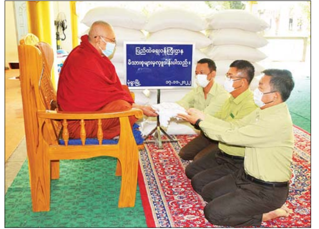
အရိယဝံသမြို့ဦးပရိယတ္တိစာသင်တိုက်၊ ဧရာဝတီတိုင်းဒေသကြီး ပုသိမ် မြို့နယ်ရှိ လေးမျက်နှာပရိယတ္တိစာသင်တိုက်တို့သို့ ဆန်ကြာဆံများ ကိုလည်းကောင်း ဆရာတော်၊ သံဃာတော်များအတွက် တာဝန်ရှိသူ များက သွားရောက်ဆက်ကပ်လှူဒါန်းကြကြောင်း သိရသည်။

ပြည်ထဲရေးဝန်ကြီးဌာန တပ်ဖွဲ့ဝင်/ဝန်ထမ်း အရာထမ်း၊ အမှုထမ်း မိသားစုများက မြို့နယ်အသီးသီးရှိ ဘုန်းတော်ကြီးကျောင်းများသို့ ဆွမ်းဆန်တော်နှင့် ဆန်ကြာဆံများ ဆက်ကပ်လှူဒါန်းလျက်ရှိသည်။