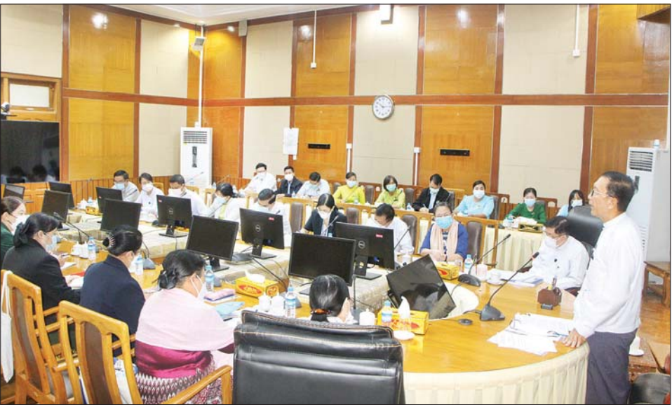
တိုးမြှင့် ဆောင်ရွက်လာစေရန် ဖြစ်ကြသော ဦးမောင်မောင်ဝင်း ကြိုးပမ်းကြစေလိုကြောင်း မှာ နှင့် ဒေါ်သန်းသန်းလင်းတို့ က ဘဏ်လုပ်ငန်းပူးပေါင်း ဆောင်ရွက်မှု၊ ကုန်သွယ်မှုတိုးမြှင့် ထို့နောက် ဒုတိယဝန်ကြီးများ ရေးနှင့် ရင်းနှီးမြှုပ်နှံမှုတိုးမြှင့် သတင်းစဉ်

ဟု လမ်းညွှန်မှာကြားထားမှုရှိပါ ကြောင်း၊ သို့ဖြစ်ရာ နိုင်ငံ ကိုယ်စားပြု သွားရောက်တာဝန် ထမ်းဆောင်ကြခြင်းဖြစ်၍ စီးပွား ရေးပူးပေါင်းဆောင်ရွက်မှု ပိုမို အားကောင်းလာစေရေး ဆောင် ရွက်ကြရာတွင် နိုင်ငံတော်၏ ပကတိ အခြေအနေမှန်များကို သေချာစွာ အသိပေးရှင်းပြပေးကြ စေလိုကြောင်း၊ ထို့ပြင် ပြည်ပ တွင် သွားရောက်လုပ်ကိုင်နေကြ သည့် မြန်မာအလုပ်သမားများ၏ လွှဲပို့ငွေများကို တရားဝင်ဘဏ် လမ်းကြောင်းဖြင့် လွှဲပို့နိုင်ရေး ကိုလည်း ညှိနှိုင်းပေါင်းစပ် ဆောင်ရွက်ပေးကြစေလိုကြောင်း၊ မိမိတို့ ရောက်ရှိတာဝန်ထမ်း ဆောင်သောနိုင်ငံအပြင် အခြား ကမ္ဘာ့နိုင်ငံများနှင့် စီးပွားရေး ပူးပေါင်းဆောင်ရွက်မှုများကို ပိုမို