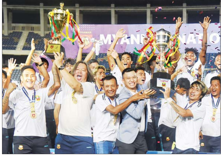
၂၀၂၂ ရာသီ MNL အမှတ်ပေးချန်ပီယံ ရှမ်းယူနိုက်တက်အသင်း အောင်ပွဲခံနေစဉ်။

ရန်ကုန် နိုဝင်ဘာ ၁၆ မြန်မာ့ပင်လယ်ပြင်အတွင်း ငါးဖမ်းဆီးရာတွင် ငါးအထိအမိကောင်း၍ ဈေးကွက်၌ ဈေးကောင်းရရှိလျက်ရှိရာ ရန်ကုန်မြို့ရှိ ငါးဖမ်းစက်လှေများ ဆိုက်ကပ်ရာ ဆိပ်ကမ်းကိုးခု၌ ပင်လယ်ပြင်ရေထွက်ကုန်ပို့ဆောင်သော စက်လှေများဖြင့် စည်ကားလျက်ရှိကြောင်း သိရသည်။ မြန်မာ့ပင်လယ်ပြင်အတွင်း ပွင့်လင်းရာသီအစ နိုဝင်ဘာလတွင် ငါး/ပုစွန် အထိအမိကောင်းမှုကြောင့် ပြည်တွင်းစားသုံးမှုလုံ့လုံသည့်အပြင် အိမ်နီးချင်းနိုင်ငံများသို့ တင်ပို့နိုင်မှုကြောင့် စက်သုံးဆီ ဈေးနှုန်းမတည်ငြိမ်မှုကို ကျော်လွှားနိုင်ပြီး စာမျက်နှာ ၂၂ ကော်လံ ၁ ❖