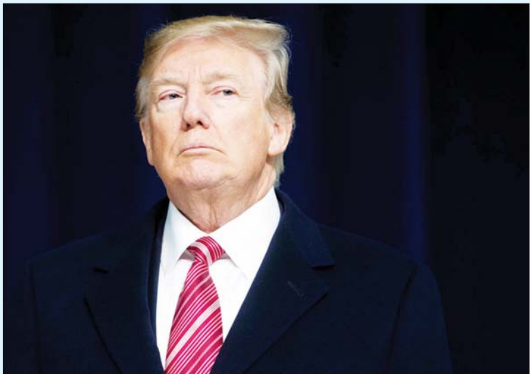
အမေရိကန် သမ္မတဟောင်း ဒေါ်နယ်ထရမ်။

စိုက်မှုများရှောင်ရှားရန် ကြိုးပမ်းနေခြင်းဖြစ်သည် ဟုလည်း အချို့ကသုံးသပ်ကြသည်။ အက်ဖ်ဘီအိုင်အေးဂျင့်များသည် ထရမ်၏ နေအိမ်တွင် အထောက်အထားအချက်အလက်များ ကို ရှာဖွေကြသည်။ ကြားဖြတ်ရွေးကောက်ပွဲတွင် မျှော်မှန်းထားသလောက် အောင်မြင်မှုမရရှိသည့် အပေါ်တာဝန်ယူရန် ထရမ်ကို ရီပတ်ဘလီကန် အချို့က တောင်းဆိုထားကြသည်။ အင်န်အိတ်ချ်ကေ