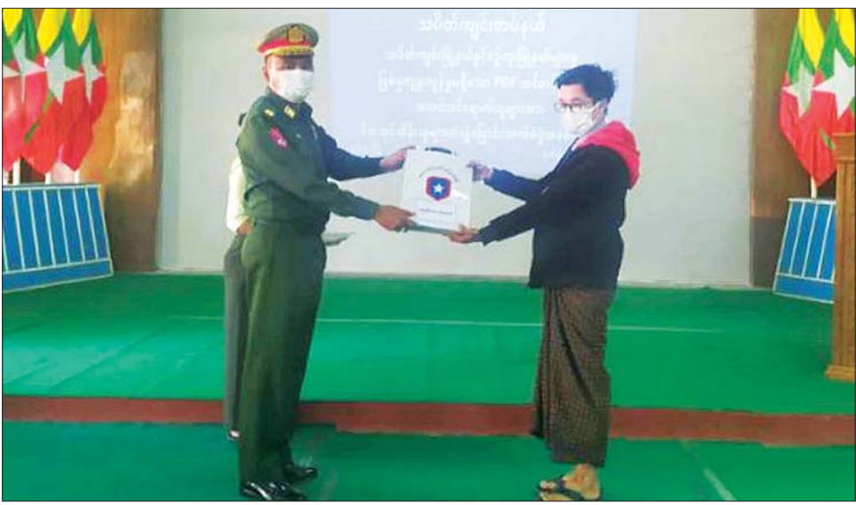
ကျူးလွန်ခဲ့ခြင်းမရှိသော PDF အဖွဲ့ဝင်များက သက်ဆိုင်ရာ တာဝန်ရှိသူများက ၎င်းတို့၏ မိဘ တိုင်းဒေသကြီးနှင့်ပြည်နယ်အသီးသီး၌ ဥပဒေဘောင် အဖွဲ့ဝင် အဖွဲ့ဝင်များကို ပြန်လည်ကြိုဆိုလိုက်ကြသဖြင့် အတွင်း ပြန်လည်ဝင်ရောက်လျက်ရှိကြသဖြင့် ရှိကြောင်း သတင်းရရှိသည်။ သတင်းစဉ်

PDF အပါအဝင် အဖွဲ့အစည်းအမျိုးမျိုးတို့အနေ ဖြင့် နိုင်ငံတော်၏ ရှေ့လုပ်ငန်းစဉ်များတွင် ပါဝင် ပူးပေါင်းဆောင်ရွက်နိုင်ရေး သတ်မှတ်စည်းကမ်းချက် များနှင့်အညီ ဥပဒေဘောင်အတွင်းသို့ လက်နက် အပ်နှံပြီး ပြည်သူ့ဘဝသို့ ပြန်လည်ဝင်ရောက်ခြင်း ပြုမည်ဆိုပါက ကြိုဆိုလိုက်သည့်မည်ဖြစ်ကြောင်း နိုင်ငံတော်အစိုးရက ထုတ်ပြန်ထားပြီးဖြစ်ရာ ပြစ်မှု