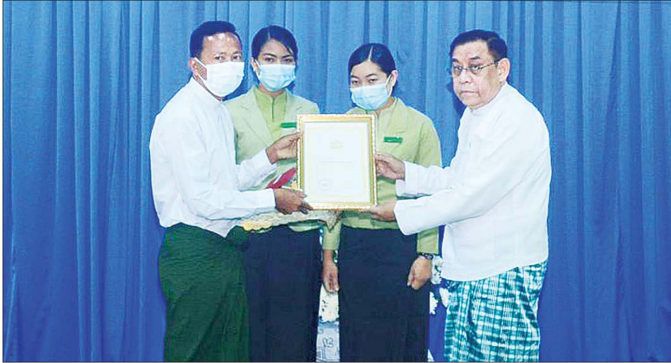
များ ချီးမြှင့်အပ်နှင်းပြီး ရဲဗလတံဆိပ်ရရှိသူများ ကိုယ်စား ရဲဗလတံဆိပ်ရရှိသူတစ်ဦးက ကျေးဇူးတင် စကားပြောကြား၍ တိုင်းဒေသကြီးဝန်ကြီးချုပ်က မိသားစုဝင်များကို ရင်းရင်းနှီးနှီး တွေ့ဆုံနှုတ်ဆက်

နေပြည်တော် နိုဝင်ဘာ ၁၆ တနင်္သာရီတိုင်းဒေသကြီး ဝန်ကြီးချုပ် ဦးမြတ်ကို သည် တိုင်းဒေသကြီးဝန်ကြီးများ၊ တာဝန်ရှိသူများနှင့် အတူ ယနေ့နံနက်ပိုင်းက မြိတ်ခရိုင် အထွေထွေ အုပ်ချုပ်ရေးဦးစီးဌာန ကျွန်းရတနာခန်းမတွင် မြိတ် ခရိုင်အတွင်း နိုင်ငံတော်နှင့် နိုင်ငံသားများအတွက် ထူးချွန်ပြောင်မြောက်စွာ စွမ်းစွမ်းတမံ တာဝန် ထမ်းဆောင်ခဲ့သူများကို ရဲဗလတံဆိပ်နှင့် ဂုဏ်ပြု လွှာ ချီးမြှင့်အပ်နှင်းပွဲသို့ တက်ရောက်၍ ဆုတံဆိပ်နှင့် ဂုဏ်ပြုမှတ်တမ်းလွှာများ ချီးမြှင့်အပ်နှင်းကြသည်။ ဂုဏ်ပြုပွဲတွင် တိုင်းဒေသကြီးဝန်ကြီးချုပ်က အမှာစကားပြောကြားပြီး မြိတ်ခရိုင်မှ ရဲဗလတံဆိပ် ရရှိသူ လေးဦးကို ရဲဗလတံဆိပ်နှင့် ဂုဏ်ပြုလွှာများ ချီးမြှင့်အပ်နှင်းသည်။ (ယာပုံ) ယင်းနောက် ကမ်းရိုးတန်းဒေသ တိုင်းစစ်ဌာန ချုပ် တိုင်းမှူး ဗိုလ်ချုပ်စောသန်းလှိုင် က ရဲဗလ တံဆိပ်ရရှိသူ သုံးဦးကို ရဲဗလတံဆိပ်နှင့် ဂုဏ်ပြုလွှာ