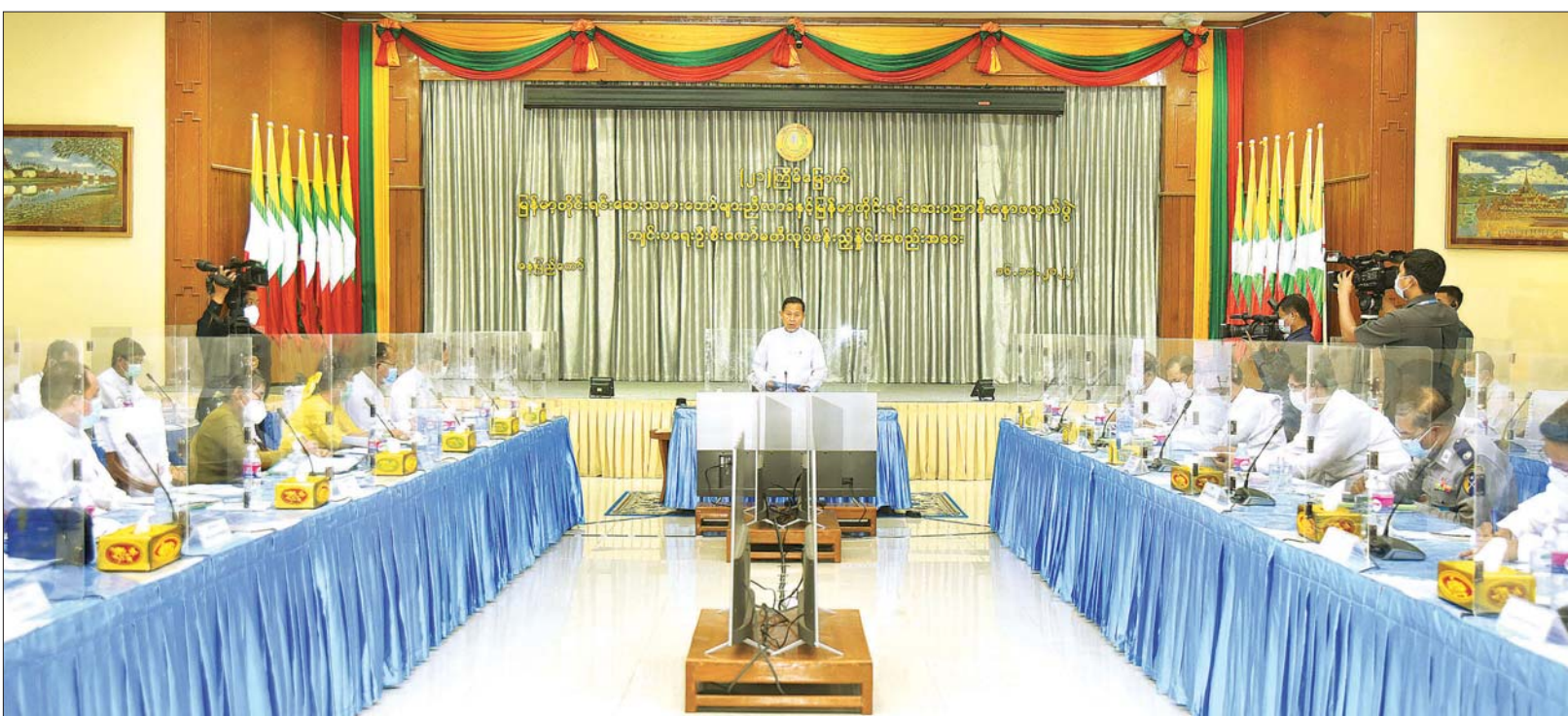
နိုင်ငံတော်စီမံအုပ်ချုပ်ရေးကောင်စီ ဒုတိယဥက္ကဋ္ဌ ဒုတိယဝန်ကြီးချုပ် ဒုတိယဗိုလ်ချုပ်မှူးကြီး စိုးဝင်း (၂၁) ကြိမ်မြောက် မြန်မာ့တိုင်းရင်းဆေးသမားတော်များညီလာခံနှင့် မြန်မာ့တိုင်းရင်းဆေးပညာ နှီးနှောဖလှယ်ပွဲ ကျင်းပရေးဦးစီးကော်မတီနှင့် လုပ်ငန်းကော်မတီ ညှိနှိုင်းအစည်းအဝေးတွင် အမှာစကားပြောကြားစဉ်။

နေပြည်တော် နိုဝင်ဘာ ၁၆ (၂၁) ကြိမ်မြောက် မြန်မာ့တိုင်းရင်းဆေး သမားတော်များညီလာခံနှင့် မြန်မာ့တိုင်းရင်းဆေးပညာ နှီးနှောဖလှယ်ပွဲကျင်းပရေး ဦးစီးကော်မတီနှင့် လုပ်ငန်းကော်မတီညှိနှိုင်းအစည်းအဝေးကို ယနေ့ မွန်းလွဲပိုင်းတွင် နေပြည်တော်ရှိ ကျန်းမာရေးဝန်ကြီးဌာန အစည်းအဝေးခန်းမ၌ ကျင်းပရာ (၂၁) ကြိမ်မြောက် မြန်မာ့တိုင်းရင်းဆေးသမားတော်များညီလာခံနှင့် မြန်မာ့တိုင်းရင်းဆေးပညာ နှီးနှောဖလှယ်ပွဲကျင်းပရေး ဦးစီးကော်မတီနာယက နိုင်ငံတော်စီမံအုပ်ချုပ်ရေးကောင်စီ ဒုတိယဥက္ကဋ္ဌ ဒုတိယဝန်ကြီးချုပ် ဒုတိယဗိုလ်ချုပ်မှူးကြီး စိုးဝင်း တက်ရောက်အမှာစကားပြောကြားသည်။ စာမျက်နှာ ၄ ကော်လံ ၁ ၀