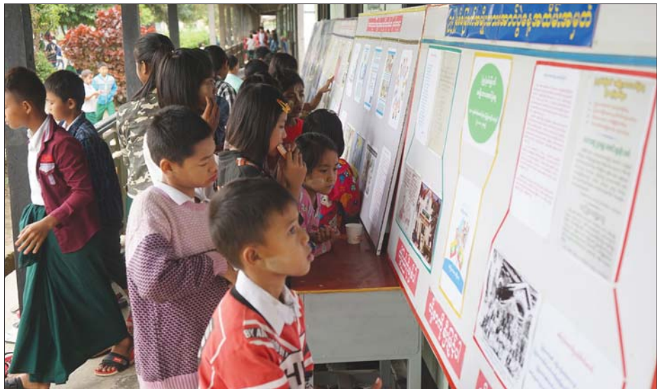
အမျိုးသားနေ့အကြောင်းကို လူငယ်များ ပိုမိုသိရှိစေရန် ပြန်ကြားရေးနှင့် ပြည်သူ့ဆက်ဆံရေးဦးစီးဌာနက ပြုလုပ်သည့် နံရံကပ်စာစောင်ပြပွဲတစ်ခု။

မြန်မာတို့ ဘာတွေပြင်ဆင်ကြရပါမလဲ ပြည်သူလူထုတစ်ရပ်လုံးဟာ တစ်ဦးချင်း တစ်ယောက်ချင်းမှသည် အဖွဲ့အစည်းတိုင်းဟာ ကျွန်တော်တို့ရဲ့အချိန်တွေ၊ စွမ်းအားတွေနဲ့ နိုင်ငံရဲ့ သယံဇာတကြွယ်ဝမှုတို့ကို မိတ်ဆွေဖြစ်ဖို့ တာစု ကြရလိမ့်မယ်။ လက်နက်ခဲယမ်းတွေအစား တူ၊ တံစဉ်များများကိုင်၊ လယ်ထွန်စက်ကို မောင်း၊ တောင်လိုပုံနေတဲ့ စပါးတွေကို ခေတ်မီဆန် ကြိတ်စက်ကိုပို့၊ ဆီစက်တွေကို လျှပ်စစ်တွေနဲ့ မောင်းနိုင်ခဲ့ရင် ဆီနဲ့ ရေချိုးနိုင်ပါမယ်။ တိုင်းရင်းသား လယ်သမားကြီးတွေဟာ အိမ်နီးချင်းနိုင်ငံတွေကြား မော်ကြွားစရာ ဖြစ်ပါလိမ့်မယ်။ ထိုထိုသော နိုင်ငံ တွေကို ယနေ့မြန်မာ့လူငယ်တွေ သွားရောက် အလုပ်လုပ်ကိုင်စရာမလို မိဘတို့ကို နီးနီးကပ်ကပ်