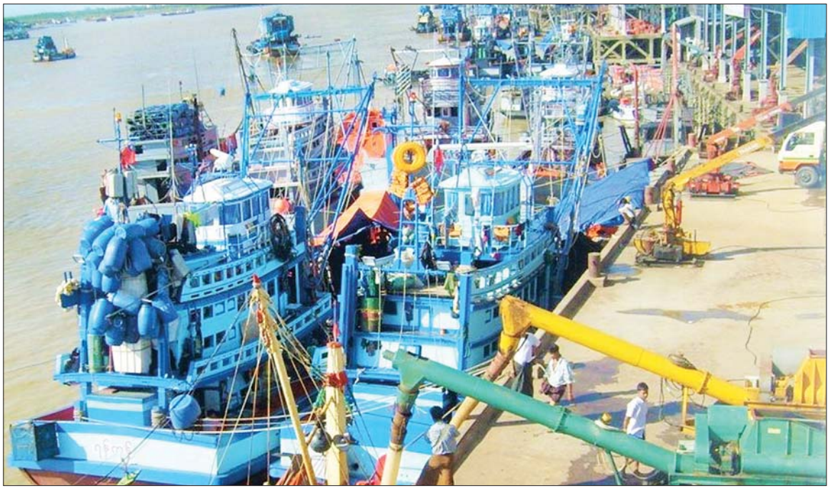
ငါးဖမ်းစက်လှေများ ရန်ကုန်ဆိပ်ကမ်းတစ်ခု၌ ဝင်ရောက်ဆိုက်ကပ်ထားသည်ကို တွေ့ရစဉ်။

ရန်ကုန် နိုဝင်ဘာ ၁၆ ၂၀၂၂ ရာသီ MNL ပြိုင်ပွဲ နောက်ဆုံးနေ့ကို နိုဝင်ဘာ ၁၆ ရက်က သုဝဏ္ဏကွင်း၌ ကျင်းပရာ ရှမ်းယူနိုက်တက်အသင်းက အား/ကာသိပွဲအသင်းကို တစ်ဂိုး-ဂိုးမရှိဖြင့် အနိုင်ရရှိပြီး ချန်ပီယံဆုရရှိခဲ့သည်။ ယခုနောက်ပိုင်း MNL ပြိုင်ပွဲတွင် ကြီးစိုးထားသည့် ရှမ်းယူနိုက်တက်အသင်းသည် နောက်ဆုံးငါးရာသီအတွင်း လေးရာသီမြောက် ချန်ပီယံဆုနှင့်အတူ ရှုံးပွဲမရှိစံချိန်ပါ ရရှိပြီး ဗိုလ်စွဲနိုင်ခဲ့သည်။ ရှမ်းယူနိုက်တက်အသင်းသည် ၂၀၁၉ ရာသီက ဗိုလ်စွဲရာတွင်လည်း ရှုံးပွဲမရှိစံချိန်ရရှိဖူးပြီး ဒုတိယအကြိမ် ရှုံးပွဲမရှိစံချိန်ဖြင့် ဗိုလ်စွဲခဲ့ခြင်းဖြစ်သည်။ စာမျက်နှာ ၁၁ ကော်လံ ၁ ၀