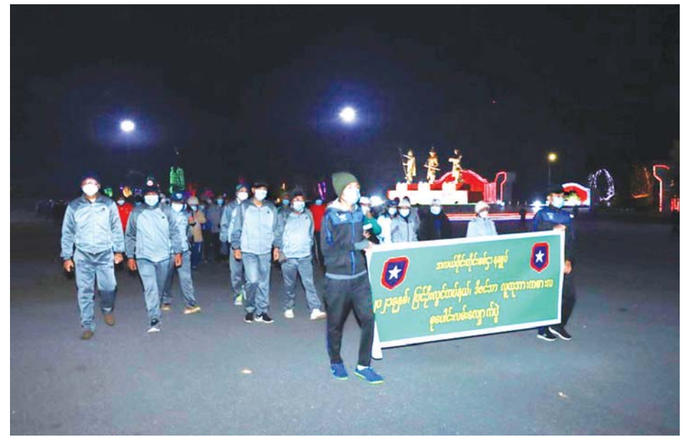
၂၀၂၁ ခုနှစ် ဒီဇင်ဘာ ၂၅ ရက်က အလယ်ပိုင်းတိုင်းစစ်ဌာနချုပ်မှ စစ်သည်မိသားစုဝင်များ လူထုစုပေါင်း လမ်းလျှောက်ပွဲ ကျင်းပစဉ်။

သန်မာစေပါသည်။ အစားထိုး ခန္ဓာတစ်သျှူးများ ဖြစ်ထွန်းမှုနှင့်အတူ ကယ်လ်ဆီယမ်လျော့နည်းလာမှု ကို တားဆီးပေးနိုင်ခြင်းက အရိုးကိုပို၍ သိပ်သည်း စေပြီး နောင်တွင် အရိုးပွရောဂါဖြစ်မည့်ဘေး၊ အရွယ် အို ပေါင်ရိုးကျိုးခြင်းဘေးများမှ ရှောင်ရှားနိုင်ပါသည်။ လမ်းလျှောက်ခြင်းက ခန္ဓာကိုယ်အောက်ပိုင်းကို ပို၍သန်မာစေပြီး ခန္ဓာကိုယ်အစိတ်အပိုင်းများ တစ်ခုနှင့်တစ်ခု ဟန်ချက်ညီနေရန် အကူအညီ ပေးနေသကဲ့သို့ လမ်းလျှောက်သည့်အခါ အရိုးအဆစ် တစ်ခုနှင့် တစ်ခုအကြား ချောဆီကို အားဖြည့်ပေး သလိုဖြစ်သည့်အတွက် အရိုးကျိုးပေါင်းနှင့် အဆစ် များ ရောင်ရမ်းနာကျင်ခြင်းကိုလည်း များစွာ လျော့ပါးသက်သာစေသည်ဟု ဆိုပါသည်။ နာတာရှည်လူနာများ ပြန်လည်နာလန်ထရေး အစီအစဉ်မှာလည်း လမ်းလျှောက်လေ့ကျင့်ခန်းက မပါမဖြစ်ပါ။ အထူးသဖြင့် အဆစ်အစားထိုး ကုသခံ ထားရသူများ၊ လေဖြတ်ဝေဒနာရှင်များ၊ အချို့သော နုလုံးရောဂါသည်များ၊ သွေးပြန်ကြောထုံးလူနာများ အတွက် လမ်းလျှောက်ပေးခြင်းက လူနာကို ပို၍ တည်ငြိမ်မှုရှိစေပြီး ပိုပြီးလည်းနာလန်ထမြန်စေ သည်ကို တွေ့ရှိရပါသည်။ အဝလွန်ခြင်းနှင့် သွေးတွင်းအချို့ဓာတ်ပမာဏကို ထိန်းညှိပေးနိုင် မိမိကိုယ်ခန္ဓာအလေးချိန်ကို ထိန်းထားရန်၊