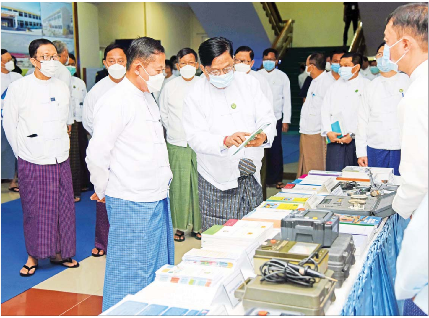
နိုင်ငံတော်စီမံအုပ်ချုပ်ရေးကောင်စီ ဒုတိယဥက္ကဋ္ဌ ဒုတိယဝန်ကြီးချုပ် ဒုတိယဗိုလ်ချုပ်မှူးကြီး စိုးဝင်းနှင့်အဖွဲ့ဝင်များ စက်မှုဝန်ကြီးဌာန၊ မူဝါဒနှင့် ပြည်ပရေးရာ ဌာန၊ နည်းပညာနှင့် ဈေးကွက်မြှင့်တင်ရေးဌာနနှင့် စက်မှုကြီးကြပ်ရေးနှင့် စစ်ဆေးရေးဦးစီးဌာန ပြခန်းများကို ကြည့်ရှုစဉ်။

ဝိုင်းဝန်းကြီးပမ်းကြရန်လို စက်မှုဝန်ကြီးဌာန၊ စက်မှုကြီးကြပ်ရေးနှင့် စစ်ဆေးရေးဦးစီးဌာနမှ SME Member Card ထုတ်ပေးထားသည့်လုပ်ငန်းပေါင်း ၄၀၉၂၉ ခုရှိပြီး ပုဂ္ဂလိကစက်မှုလုပ်ငန်းဥပဒေအရ မှတ်ပုံတင်ထား သည့်လုပ်ငန်းများအနက် အသေးစားနှင့်အလတ်စား လုပ်ငန်း သတ်မှတ်ချက်ဖြင့် ကိုက်ညီသော လုပ်ငန်းများသည်လည်း ၄၅၀၀၀ ကျော် ရှိကြောင်း၊ ထို့ပြင် အခြားဝန်ကြီးဌာန ၁၃ ခုရှိ ဦးစီးဌာနများ၌ မှတ်ပုံတင်ထားသည့် လုပ်ငန်း ၂၅၂၀၀၀ ကျော် ရှိသည်ကို စာရင်းများအရ သိရကြောင်း၊ မြန်မာ့ စီးပွားရေး ပြန်လည်ဦးမော့လာစေရေးအတွက် MSME များ၏အခန်းကဏ္ဍသည် များစွာ အရေးကြီးကြောင်း၊ မှတ်ပုံတင်ထားသည့် အသေးစား၊ အငယ်စားနှင့် အလတ်စား စီးပွားရေး (MSME) လုပ်ငန်းများ ဆက်လက်ရှင်သန်နေရန်နှင့် လုပ်ငန်းများ လည်ပတ် နေရန် အထူးလိုအပ်ကြောင်း၊ မိမိတို့အနေဖြင့် နိုင်ငံ ၏အားသာချက်အပေါ် အခြေခံပြီး အသုံးချတတ်မည် ဆိုပါက အခွင့်အလမ်းကောင်းများ ရရှိလာနိုင် ကြောင်း၊ အခွင့်အလမ်းအနေဖြင့် တစ်ကမ္ဘာလုံး တွင် စားသောက်ကုန်ဆိုင်ရာထုတ်ကုန်များ လိုအပ် နေသည့်အတွက် နည်းပညာကောင်းများသုံးစွဲပြီး အန္တရာယ်ကင်းရှင်းသော တန်ဖိုးမြင့်ထုတ်ကုန်များ၊ ဆန်းသစ်တီထွင်သည့် ထုတ်ကုန်များထုတ်လုပ်လာ နိုင်ရေး၊ ကမ္ဘာ့တန်ဖိုးမြင့်ကွင်းဆက်နှင့် အပြည်ပြည် ဆိုင်ရာပူးပေါင်းထုတ်လုပ်မှု ကွန်ရက်များသို့ဝင်ရောက် နိုင်ရန် ဝိုင်းဝန်းကြီးပမ်းကြရန်လိုအပ်ကြောင်း။ ကပ်ရောဂါကြောင့် စားသုံးသူများ၏ အပြုအမူ