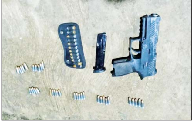
PDF အမည်ခံအကြမ်းဖက်အဖွဲ့ဝင်များထံမှ သိမ်းဆည်းရမိသည့် လက်နက်/ခဲယမ်းနှင့် ဆက်စပ်ပစ္စည်းများကို တွေ့ရစဉ်။