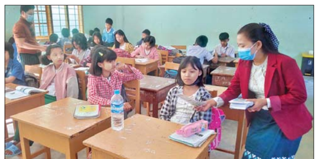
၏ (၁၀၁)နှစ်မြောက် အမျိုးသားအောင်ပွဲနေ့အထိမ်းအမှတ် အခမ်းအနားသို့ ပေးပို့သည့်သဝဏ်လွှာမှ ကောက်နုတ်ချက်၊ ဘိုမျိုး(ရွှေဘို) ၏ “သူ့ကျွန်မခံ အမျိုးသားအားမာန်”ကဗျာ၊ (၁၀၂)နှစ်မြောက်အမျိုးသားအောင်ပွဲနေ့ ဦးတည်ချက်များ၊ ပညာရေးမျှော်မှန်းချက်များ ပါရှိသည့် သတင်းစကားလက်ကမ်းစာစောင်များကို ဖြန့်ဝေကြောင်း သိရသည်။ မယ်ခွေ

ထိုသို့ဖြန့်ဝေရာတွင် မြိုင်မြို့နယ် ပြန်ကြားရေးနှင့် ပြည်သူ့ဆက်ဆံရေးဦးစီးဌာန ဝန်ထမ်းများက အမှတ်(၁) အခြေခံပညာအထက်တန်းကျောင်းရှိ ကျောင်းသား ကျောင်းသူများ၊ ဆရာ ဆရာမများအား ပြန်ကြားရေးနှင့် ပြည်သူ့ဆက်ဆံရေးဦးစီးဌာနက (၁၀၂)နှစ်မြောက် အမျိုးသားအောင်ပွဲနေ့ အထိမ်းအမှတ်အဖြစ် ထုတ်ဝေသော ဗိုလ်ချုပ်အောင်ဆန်း၏ ဖဆပလပြည်လုံးကျွတ်ညီလာခံကြီးတွင် တင်သွင်းသော ညီညွတ်ရေးအဆိုမှ ကောက်နုတ်ချက်၊ နိုင်ငံတော်စီမံအုပ်ချုပ်ရေးကောင်စီဥက္ကဋ္ဌ နိုင်ငံတော်ဝန်ကြီးချုပ် ဗိုလ်ချုပ်မှူးကြီး မင်းအောင်လှိုင်