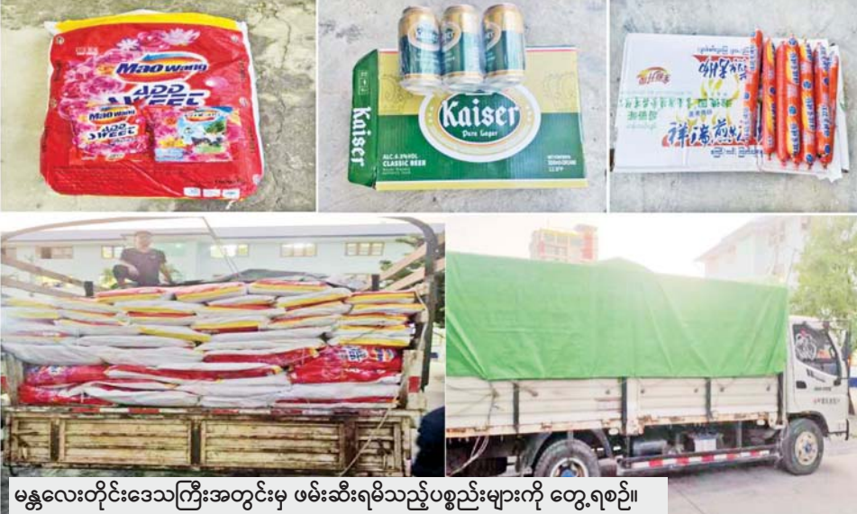
မန္တလေးတိုင်းဒေသကြီးအတွင်းမှ ဖမ်းဆီးရမိသည့်ပစ္စည်းများကို တွေ့ရစဉ်။

နေပြည်တော် နိုဝင်ဘာ ၁၅ တရားမဝင်ကုန်သွယ်မှုတိုက်ဖျက်ရေး ဦးဆောင် ကော်မတီ၏ ကြီးကြပ်ကွပ်ကဲမှုဖြင့် တရားမဝင် ကုန်သွယ်မှုများကို ဥပဒေနှင့်အညီ ထိရောက်စွာ တားဆီးအရေးယူနိုင်ရေး ဆောင်ရွက်လျက်ရှိရာ နိုဝင်ဘာ ၁၃ ရက်တွင် စစ်ကိုင်းတိုင်းဒေသကြီး တရားမဝင်ကုန်သွယ်မှုတိုက်ဖျက်ရေးအထူးအဖွဲ့၏ စီမံခန့်ခွဲမှုဖြင့် မြန်မာနိုင်ငံတစ်ဝှမ်း ဦးဆောင်သော ပူးပေါင်းစစ်ဆေးရေးအဖွဲ့က စစ်ဆေးမှုများ ဆောင်ရွက်ခဲ့ရာ စစ်ကိုင်းမြို့နယ်အတွင်း တရားဝင် စာရွက်စာတမ်း အထောက်အထားတစ်စုံတစ်ရာ တင်ပြနိုင်ခြင်းမရှိသည့် လူသုံးကုန်ပစ္စည်းနှင့် စားသောက်ကုန်ပစ္စည်းများ (ခန့်မှန်းတန်ဖိုးငွေကျပ် ၅၅၇၀၀၀၀)ကို လည်းကောင်း၊ နိုဝင်ဘာ ၁၃ ရက် နှင့် ၁၄ ရက်တို့တွင် အင်းတော်မြို့နယ်အတွင်း လိုင်စင်မဲ့ဆိုင်ကယ်နှစ်စီး (ခန့်မှန်းတန်ဖိုး ငွေကျပ် ၃၅၀၀၀၀)ကို လည်းကောင်း စုစုပေါင်း ခန့်မှန်း တန်ဖိုး ငွေကျပ် ၅၆၀၇၀၀၀၀ ကို ဖမ်းဆီးရမိခဲ့ပြီး ပို့ကုန်သွင်းကုန်ဥပဒေနှင့်အညီ အရေးယူဆောင်ရွက် လျက်ရှိသည်။ ထို့အတူ မန္တလေးတိုင်းဒေသကြီး တရားမဝင် ကုန်သွယ်မှုတိုက်ဖျက်ရေးအထူးအဖွဲ့၏ စီမံခန့်ခွဲမှု ဖြင့် စစ်ဆေးမှုများ ဆောင်ရွက်ခဲ့ရာ နိုဝင်ဘာ ၁၃ ရက်တွင် တိုင်းဒေသကြီး အကောက်ခွန်ဦးစီးဌာန ဦးဆောင်သော ပူးပေါင်းအဖွဲ့က ပြင်ဦးလွင်- မန္တလေးလမ်း မိုင်တိုင်အမှတ် ၁၇ မိုင် ၃ ယာလုံတွင် လားရှိုးမြို့မှ မန္တလေးမြို့သို့ မောင်းနှင်လာသော မော်တော်ယာဉ်တစ်စီးပေါ်၌ တရားဝင်တင်သွင်းခွင့် အထောက်အထားတစ်စုံတစ်ရာ တင်ပြနိုင်ခြင်းမရှိ သည့် စားသောက်ကုန်ပစ္စည်းမျိုးစုံ (ခန့်မှန်းတန်ဖိုး ငွေကျပ် ၁၄၄၀၀၀၀)နှင့် အဆိုပါကုန်ပစ္စည်းများ တင်ဆောင်လာသည့် Foton Truck အမျိုးအစား မော်တော်ယာဉ် တစ်စီး (ခန့်မှန်းတန်ဖိုး ငွေကျပ် ၁၅၀၀၀၀၀)ကိုလည်းကောင်း၊ နိုဝင်ဘာ ၁၄ ရက် တွင် ၁၆ မိုင် ကျောက်ချောစစ်ဆေးရေးစခန်း၌