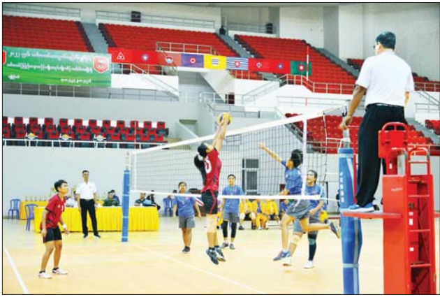
အမျိုးသမီးဘော်လီဘောပြိုင်ပွဲ ယှဉ်ပြိုင်နေမှုကို တွေ့ရစဉ်။

ကီလိုတန်းအလိုက် ပြိုင်ပွဲများကို လည်းကောင်း၊ ဇေယျာသီရိ တပ်မတော် အားကစားကွင်း၌ ပြေးခုန်ပစ်ပြိုင်ပွဲမှ အမျိုးသား/ အမျိုးသမီး မိတာ ၁၀၀၀၀ အပြေး ပြိုင်ပွဲ၊ အမျိုးသား/အမျိုးသမီး သံပြားဝိုင်းပစ်ပြိုင်ပွဲ၊ အမျိုးသမီး ၇ မျိုးစုံ မိတာ ၁၀၀ တန်းကျော် အပြေးပြိုင်ပွဲ၊ အမျိုးသမီး တုတ်ထောက်ခုန်ပြိုင်ပွဲ၊ အမျိုး သား မိတာ ၄၀၀ အပြေးပြိုင်ပွဲ၊ အမျိုးသမီး ၇ မျိုးစုံ တန်းမြင့်ခုန် ပြိုင်ပွဲ၊ အမျိုးသား/အမျိုးသမီး မိတာ ၄၀၀ အပြေးပြိုင်ပွဲ၊ အမျိုး သားအလျားခုန်ပြိုင်ပွဲ၊ အမျိုးသမီး