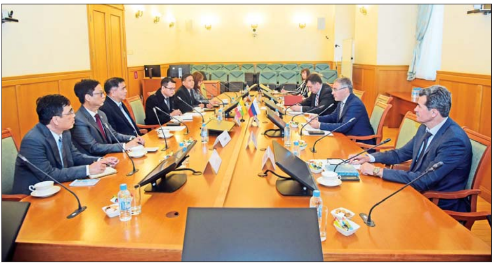
Research Nuclear University (MEPhI) ပါမောက္ခချုပ် Vladimir Schevchenko ဦးဆောင်သော တက္ကသိုလ်မှ တာဝန်ရှိသူများ နှင့်တွေ့ဆုံပြီး တက္ကသိုလ်၏ သိပ္ပံနှင့်နည်းပညာကဏ္ဍ၊ လူ့စွမ်း သင်ကြားသင်ယူမှု၊ လက်တွေ့ အားအရင်းအမြစ် ဖွံ့ဖြိုးတိုးတက် ခန်းများ၊ သုတေသနလုပ်ငန်း ရေးကိစ္စရပ်များကို ဆွေးနွေးကြ များကို လှည့်လည်ကြည့်ရှုပြီး ကြောင်း သိရသည်။ သတင်းစဉ်

ထို့နောက် ပြည်ထောင်စု ဝန်ကြီး ဦးဆောင်သည့် မြန်မာ ကိုယ်စားလှယ်အဖွဲ့သည် National Research University Moscow Power Engineering Institute (MPEI) သို့ သွားရောက်၍ ပါမောက္ခချုပ် Alexander Bryukhovskovoe ဦးဆောင်သော တက္ကသိုလ်မှ တာဝန်ရှိသူများနှင့် တွေ့ဆုံပြီး ပညာတော်သင် ကိစ္စရပ်များကို ပိုမိုအကျိုးရှိ ထိရောက်စေရေးအတွက် ရင်းရင်း နှီးနှီး ဆွေးနွေးကြသည်။ သုတေသနလုပ်ငန်းများ ကြည့်ရှု ဆက်လက်၍ ပြည်ထောင်စု ဝန်ကြီးနှင့်အဖွဲ့သည် National