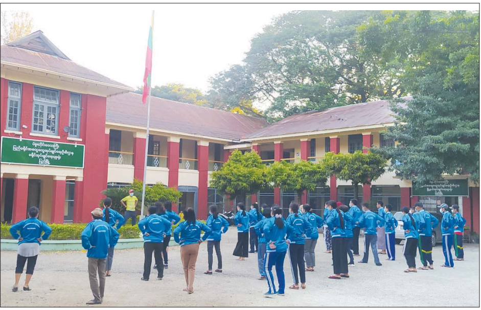
၂၀၂၁ ခုနှစ် ဒီဇင်ဘာ ၃ ရက်က ပြည်မြို့ရှိ ဌာနဆိုင်ရာများစုပေါင်း၍ ကိုယ်လက်လှုပ်ရှားအားကစား လေ့ကျင့်မှုများ ဆောင်ရွက်စဉ်။

အလုပ်ကို တွန်းအားပေးသည့် ရုပ်ပိုင်း၊ စိတ်ပိုင်း စွမ်းအားများ မိမိထံ ကိန်းအောင်း လာသည်မှာလည်း လမ်းလျှောက်ခြင်း၏ အကျိုးရလဒ်တစ်ခုပင် ဖြစ်သည်။ ထို့ကြောင့် ကျန်းမာရေးအတွက် လမ်းလျှောက်ချင်စိတ်လေးတစ်ခုကို မိမိကိုယ်မိမိ ဦးစွာပျိုးထောင်ပေးစေလိုသည်။ ဘယ်လိုမှ မအား ဘူးဆိုလျှင်တောင် နံနက်စောစော မိနစ် ၃၀ ခန့် ကြိုတင်အိပ်ရာမှထပြီး လမ်းလျှောက်ရန် အချိန်လေး တစ်ခု၊ လမ်းလျှောက်ခြင်းဖြင့် တစ်နေ့တာဘဝ ခရီးစတင်ရန် အခွင့်အလမ်းတစ်ခုကိုတော့ ထားရှိ စေချင်ပါသည်။