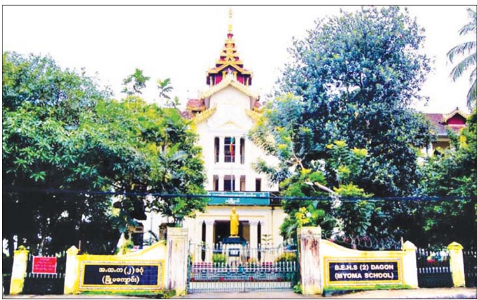
၁၉၂၀ ပြည့်နှစ် မြန်မာအမျိုးသားပညာရေးလှုပ်ရှားမှုများ၏ သမိုင်းခြေရာများ ထင်ဟပ်ရာ ယခင် မြို့မအမျိုးသားကျောင်း (အ.ထ.က (၂) ဒဂုံ) ကို တွေ့ရစဉ်။

၁၉၂၀ ပြည့်နှစ်ထဲမှာ ပေါ်ပေါက်ခဲ့တဲ့ မြန်မာအမျိုးသားပညာရေးလှုပ်ရှားမှုတစ်ရပ်ဟာ အမျိုးသားရေးကိစ္စ၊ အမျိုးသားအကျိုးစီးပွား National Interest ကောင်းကျိုးအတွက် ဖြစ်ခဲ့တယ်။ ဒီလှုပ်ရှားမှုဟာ အမျိုးသားရေးကိစ္စကို ဗဟိုပြုခဲ့တယ်။ ရန်ကုန်တက္ကသိုလ်အက်ဥပဒေဟာ မြန်မာတို့ လိုလားတဲ့ ပညာရေးဖြစ်မနေတာကြောင့် အင်္ဂလိပ်အစိုးရကို တောင်းဆိုတာဟာ လွတ်လပ်ရေးရဖို့ လှမ်းခဲ့တဲ့ အမျိုးသားရေးလှုပ်ရှားမှုကြီး ဖြစ်ခဲ့တယ်။