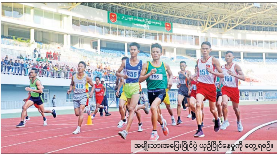
အမျိုးသားအပြေးပြိုင်ပွဲ ယှဉ်ပြိုင်နေမှုကို တွေ့ရစဉ်။

နေပြည်တော် နိုဝင်ဘာ ၁၅ ၂၀၂၂ ခုနှစ် တပ်မတော် (ကြည်း၊ ရေ၊ လေ) အားကစားပြိုင်ပွဲများကို ယနေ့နံနက်ပိုင်းမှ စတင်၍ အားကစားနည်းများအလိုက် သတ်မှတ်ထားသော အားကစားကွင်း/ရုံများ၌ စတင်ကျင်းပသည်။ တပ်မတော်(ကြည်း၊ ရေ၊ လေ) အားကစားပြိုင်ပွဲများ ဖြစ်သည့် လက်ဝှေ့ပြိုင်ပွဲကို နေပြည်တော်ရှိ စစ်ကြောရေးနှင့် တည်းခိုရေးစခန်းရှိ တပ်နယ်အားကစားခန်းမ၌ စာမျက်နှာ ၁၂ ကော်လံ ၁ ●