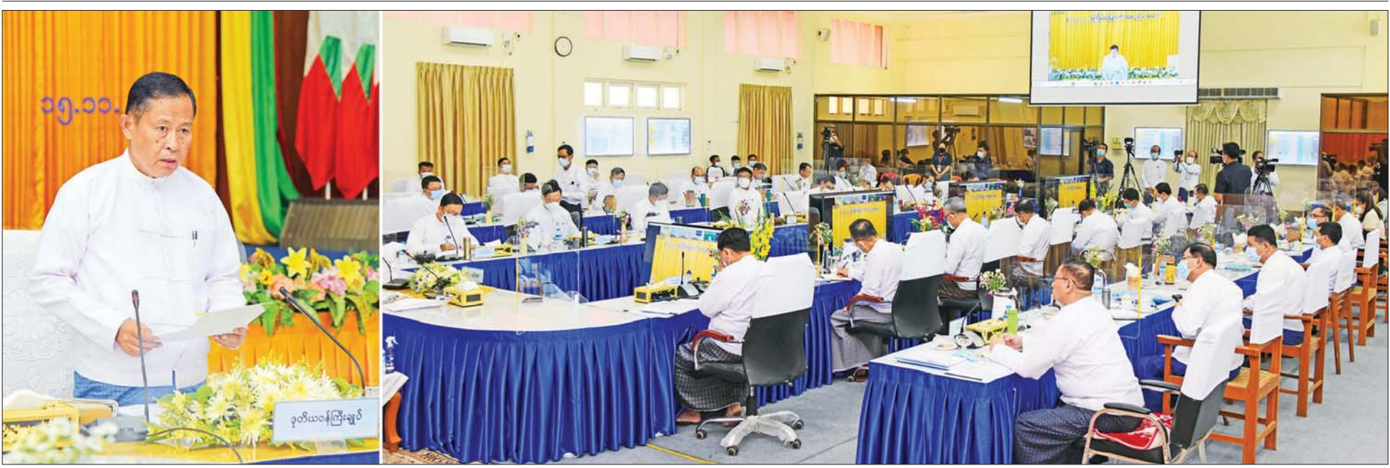
နိုင်ငံတော်စီမံအုပ်ချုပ်ရေးကောင်စီ ဒုတိယဥက္ကဋ္ဌ ဒုတိယဝန်ကြီးချုပ် ဒုတိယဗိုလ်ချုပ်မှူးကြီး စိုးဝင်း အသေးစား၊ အငယ်စားနှင့် အလတ်စား စီးပွားရေးလုပ်ငန်းများ ဖွံ့ဖြိုးတိုးတက်ရေးလုပ်ငန်းကော်မတီ အစည်းအဝေး(၁/၂၀၂၂) တွင် အမှာစကားပြောကြားစဉ်။