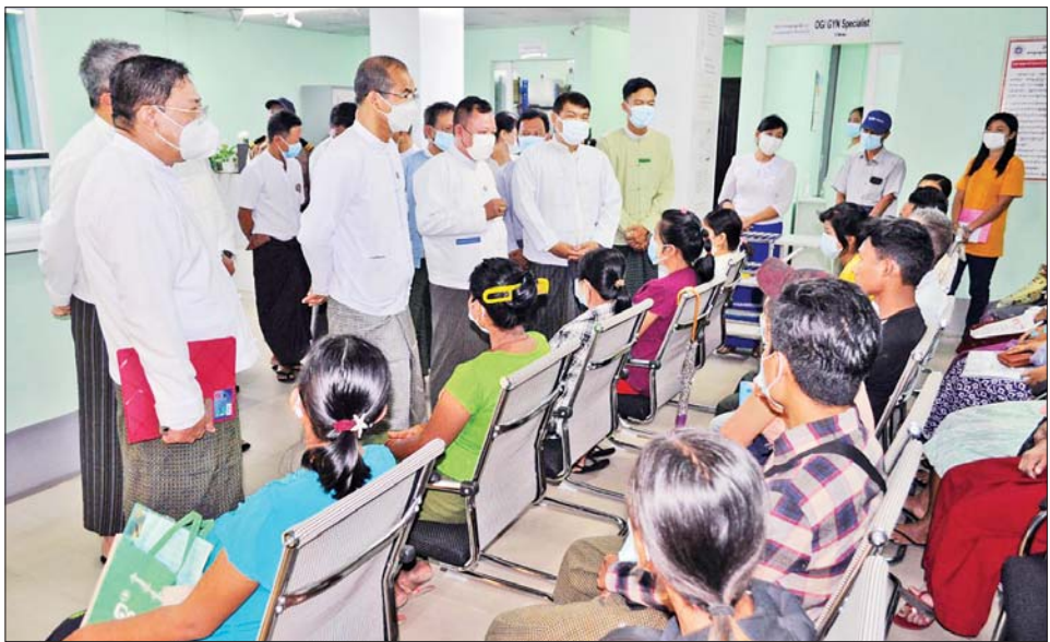
အာမခံအလုပ်သမားများ ဆေးခန်းများအပြင် လူမှုဖူလုံရေးဆေးခန်းများတွင် အဆစ်အမျက်နှင့် စာချုပ်ချုပ်ဆိုဆောင်ရွက်နေသည့် ပုဂ္ဂလိကစာချုပ်ဆေးရုံ၊ သွေးတိုးရောဂါ၊ အအေးမိ နှာစေးခြင်း၊ ဆီးချိုရောဂါ၊ အစာအိမ်နှင့် အူသိမ်ဆိုင်ရာ ရောဂါများ၊

ရွှေပြည်သာမြို့နယ်၌ အကျိုးအလုပ်သမား ၉၆၀၀၀ ကျော်ရှိပြီး ဝင်အာမခံအလုပ်သမား ၁၂၀၀၀ ကျော်ရှိပြီး လူမှုဖူလုံရေးကဲဝဲလ်အထွေထွေရောဂါကုဆေးခန်း (မင်္ဂလာဒုံ)ကို မတ် ၄ ရက်တွင် စတင်ဖွင့်လှစ်ခဲ့ကာ နိုဝင်ဘာ ပထမပတ်အထိ အာမခံအလုပ်သမား ၁၆၀၀၀၀ ကျော်ကို ကျန်းမာရေးစောင့်ရှောက်မှု ပေးနိုင်ခဲ့ကြောင်း သိရသည်။ အလားတူမင်္ဂလာဒုံမြို့နယ်၌ အကျိုးဝင်အာမခံအလုပ်သမားများအား ကျန်းမာရေးစောင့်ရှောက်မှု ပေးနိုင်ခဲ့ကြောင်း သိရသည်။ အဆိုပါ ဆေးခန်းများသို့ ကြည့်ရှုစစ်ဆေးစဉ်ဒုတိယဝန်ကြီး