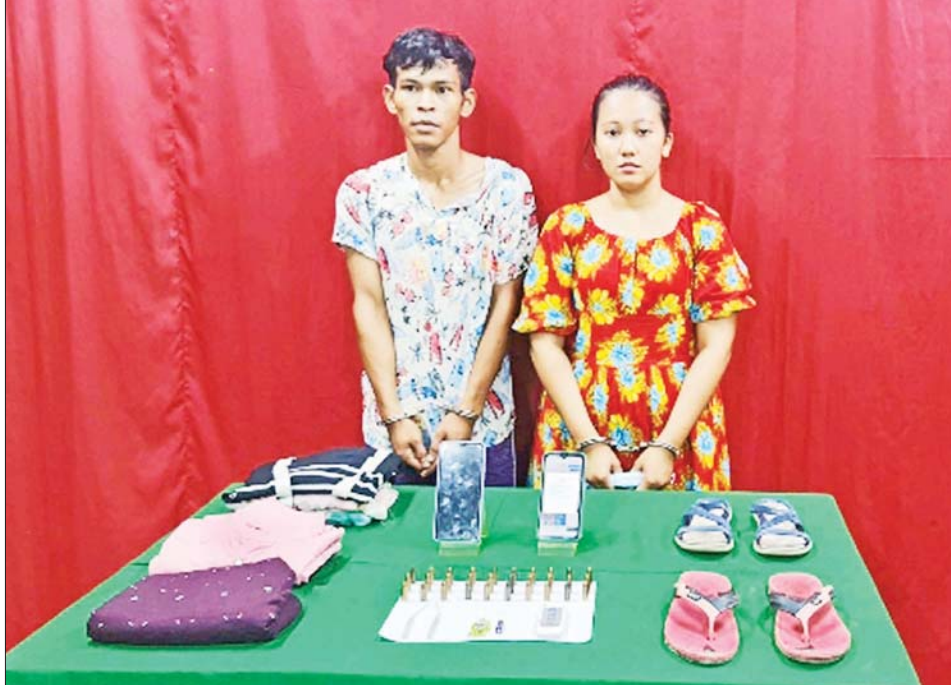
(တရားခံ ဝဲမှယာ) ကောင်းထက်(ခ)ဖိုးစီ ၊ မချမ်းမြေ့သူ(ခ)ဂျူးဂျူး(ခ)JULU

အင်းစိန်ဗဟိုအကျဉ်းထောင်အား ပါဆယ်ထုပ်များအတွင်း လက်လုပ်မိုင်းတပ်ဆင်ကာ ဖောက်ခွဲမှုကျူးလွန်ခဲ့သည့် တရားခံများနှင့် ပြစ်မှုကျူးလွန်စဉ်က ၎င်းတို့ဝတ်ဆင် အသုံးပြုခဲ့သည့်ပစ္စည်းများ။