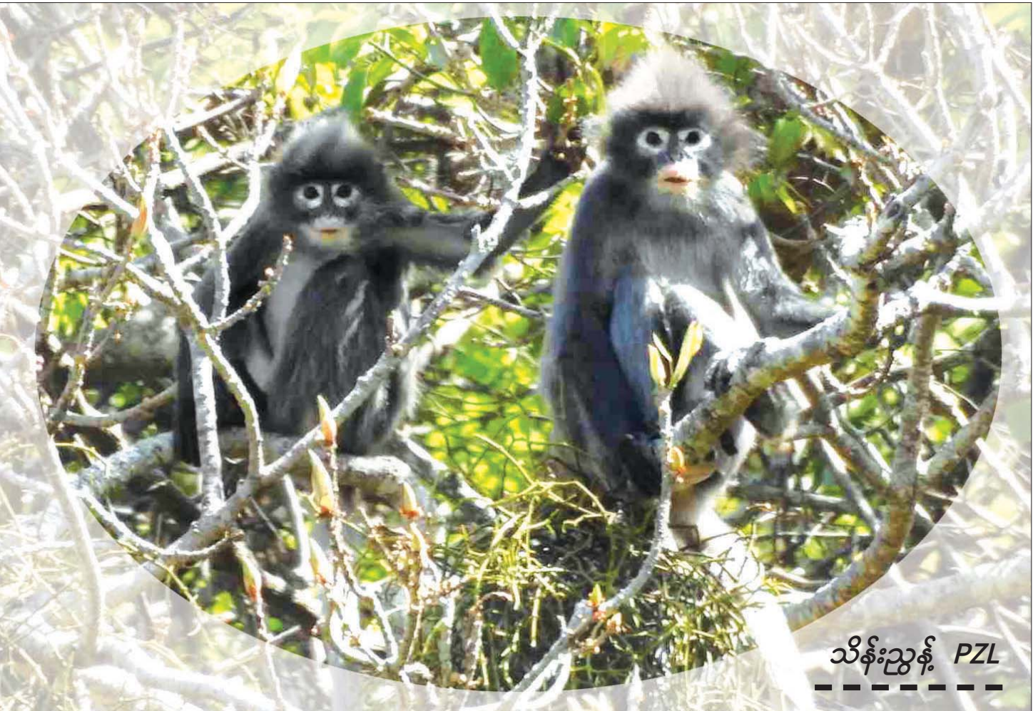
သိန်းညွန့် PZL

ယခင်ကာလက “မျောက်မျက်ကွင်းပြာ” ဟု သိထားခဲ့ကြသော မျောက်များကို ဒီအင်နီအေ (D.N.A) ကို စစ်ဆေးရာမှ မျောက်မျိုးစိတ်အသစ်ဖြစ် သော “ပုပ္ပားမျောက်မြီးရှည်” မျိုးစိတ်အသစ် ပျော်စံ မြူးတူးရာ ဘေးမဲ့တောတစ်ခုလည်းဖြစ်သည်။ ဦးခေါင်း နှင့် ခန္ဓာကိုယ်အရှည် ၅၂-၆၂ စင်တီမီတာရှိသော ယင်းမျောက်မျိုးစိတ်များကို ဧရာဝတီမြစ်နှင့် သံလွင် မြစ်အကြား မြန်မာနိုင်ငံအလယ်ပိုင်းနှင့် မွန်၊ ကယား တစ်ခွင်နှင့် ကရင်ပြည်နယ်တောင်တန်း အနောက်