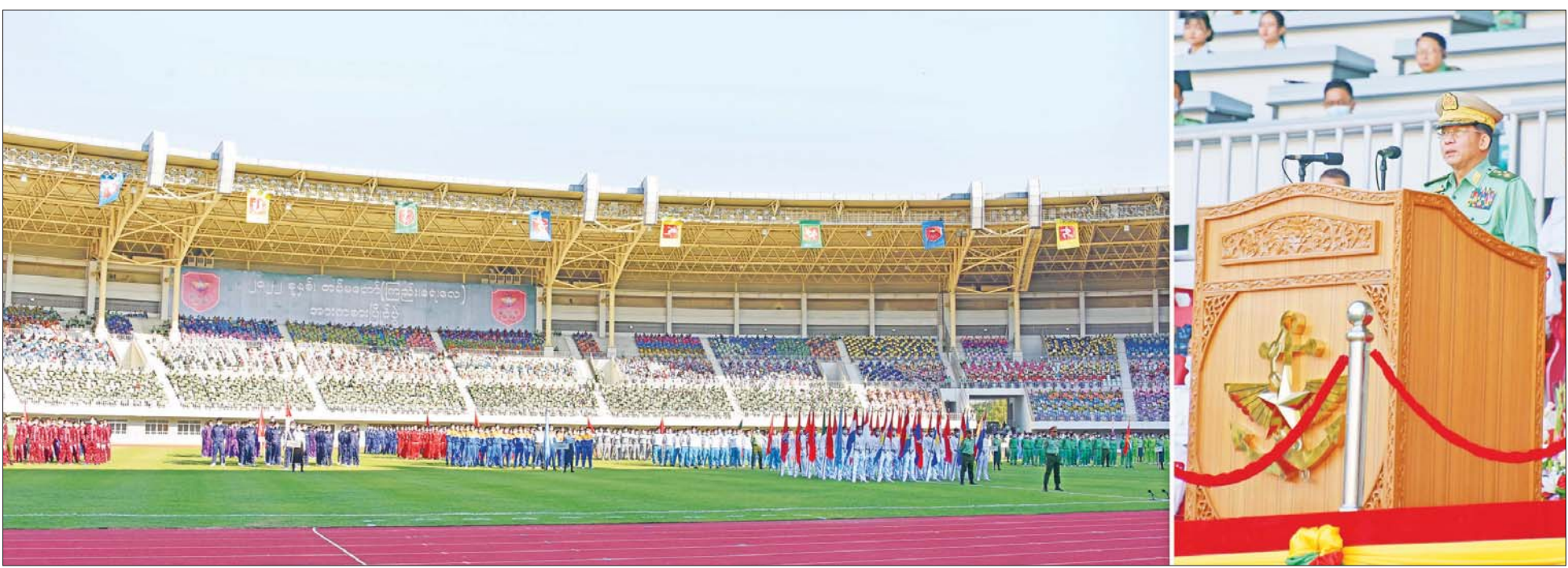
နိုင်ငံတော်စီမံအုပ်ချုပ်ရေးကောင်စီဥက္ကဋ္ဌ တပ်မတော်ကာကွယ်ရေးဦးစီးချုပ် ဗိုလ်ချုပ်မှူးကြီး မင်းအောင်လှိုင် ၂၀၂၂ ခုနှစ်၊ တပ်မတော် (ကြည်း၊ ရေ၊ လေ) အားကစားပြိုင်ပွဲဖွင့်ပွဲ အခမ်းအနားတွင် အဖွင့်မိန့်ခွန်းပြောကြားစဉ်။