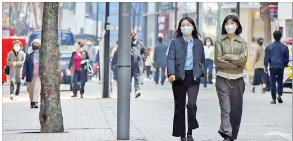
တောင်ကိုရီးယားနိုင်ငံ၌ ကိုဗစ်-၁၉ ကာကွယ်ရန် ပါးစပ်၊ နှာခေါင်းစည်းတပ်ကာ သွားလာနေသူများကို တွေ့ရစဉ်။