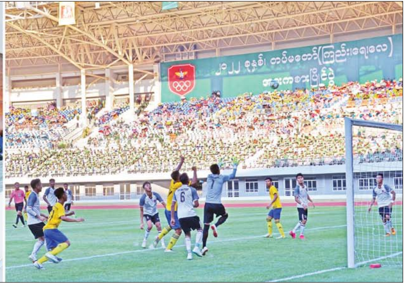
နိုင်ငံတော်စီမံအုပ်ချုပ်ရေးကောင်စီဥက္ကဋ္ဌ တပ်မတော်ကာကွယ်ရေးဦးစီးချုပ် ဗိုလ်ချုပ်မှူးကြီး မင်းအောင်လှိုင်နှင့် အဖွဲ့ဝင်များ တပ်မတော်ကာကွယ်ရေးဦးစီးချုပ်ဖလား (က) အဆင့် ဘောလုံးပြိုင်ပွဲ ပထမအကြိမ် ဗိုလ်လုပွဲအဖြစ် အရှေ့ပိုင်းတိုင်းစစ်ဌာနချုပ် ကိုယ်စားပြုအသင်းနှင့် အလယ်ပိုင်းတိုင်းစစ်ဌာနချုပ် ကိုယ်စားပြုအသင်းတို့ ယှဉ်ပြိုင်ကစားနေမှုကို ကြည့်ရှုအားပေးစဉ်။

စာမျက်နှာ ၃ မှ တာဝန်ထမ်းဆောင်နေကြရသည့် မိမိတို့တပ်မတော် သားများသည် ကျန်းမာကြံ့ခိုင်မှု အမြဲပြည့်ဝနေရန် လိုအပ်ကြောင်း၊ ကျန်းမာကြံ့ခိုင်နေမှသာ မိမိတို့၏ ရည်မှန်းချက် တာဝန်များကို ကျေပွန်အောင်ထမ်းဆောင်နိုင်မည်ပင်ဖြစ်ကြောင်း၊ ထို့ကြောင့် ကျန်းမာအောင်နေ သန်စွမ်းအောင်လေ့ကျင့် ဟူသည့်အတိုင်း စားသောက်နေထိုင်မှုကို ဂရုပြုနေထိုင်ကြရမည့် အပြင် ကိုယ်ကာယကြံ့ခိုင်မှုနှင့် သက်လုံပြည့်ဝမှု ရရှိစေရေးအတွက် နည်းစနစ်မှန်ကန်စွာ စဉ်ဆက်မပြတ် အားထုတ် ကြိုးပမ်းနေကြရမည်ဖြစ်ကြောင်း။