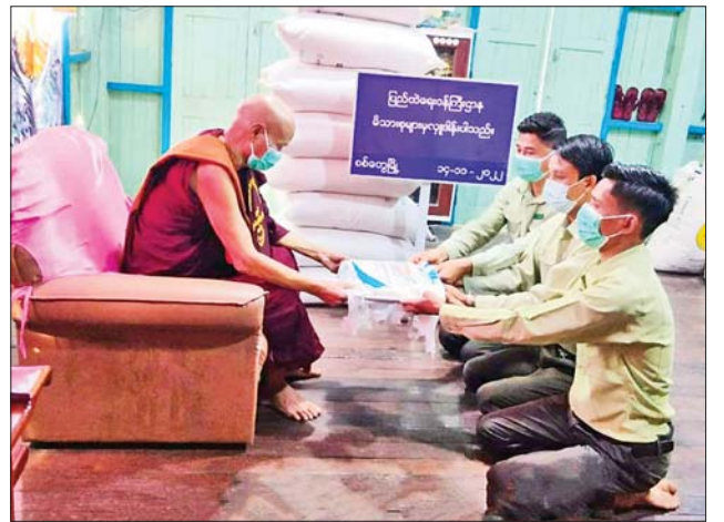
နဂါးပရိယတ္တိစာသင်တိုက်၊ ရှမ်းပြည်နယ် တောင်ကြီးမြို့နယ်ရှိ လွယ်တော်ကျောင်းတိုက်နှင့် လားရှိုးမြို့နယ်ရှိ လွယ်ဝိန်းတောရ ကျောင်းတိုက်တို့သို့ ဆန်ကြာဆံများကိုလည်းကောင်း ဆရာတော်၊ သံဃာတော်များအတွက် တာဝန်ရှိသူများက သွားရောက်ဆက်ကပ် လှူဒါန်းခဲ့ကြကြောင်း သိရသည်။

နေပြည်တော် နိုဝင်ဘာ ၁၄ ပြည်ထဲရေးဝန်ကြီးဌာန တပ်ဖွဲ့ဝင်/ဝန်ထမ်း အရာထမ်း၊ အမှုထမ်း မိသားစုများက မြို့နယ်အသီးသီးရှိ ဘုန်းတော်ကြီးကျောင်းများသို့ ဆွမ်းဆန်တော်နှင့် ဆန်ကြာဆံများ ဆက်ကပ်လှူဒါန်းခြင်းကို ဆောင်ရွက်လျက်ရှိသည်။