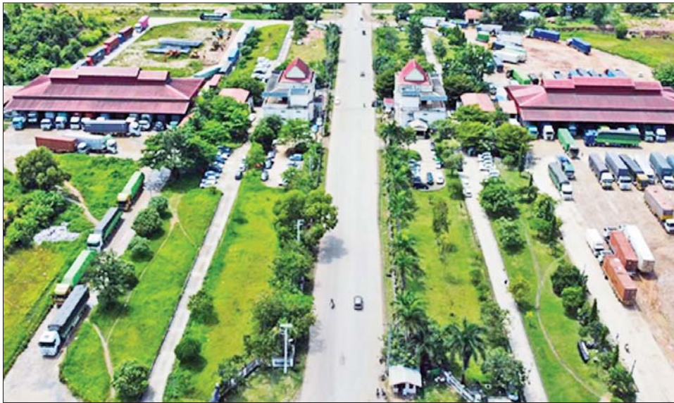
လမ်းကြောင်းတစ်လျှောက်၊ ကုန်သွယ်ရေးဇုန်၊ ပေးလျက်ရှိသည်။ ထိုနည်းတူ ကုန်စိမ်း ပို့ကုန်များ BCF တံတား-၂ တို့မှတစ်ဆင့် တစ်ဖက်နိုင်ငံသို့ ဖြစ်သည့် ကြက်သွန်နီ၊ ငရုတ်၊ ဂေါ်ဖီထုပ်တို့ကို အမြန်ရောက်ရှိရေးအတွက် ဦးစားပေးဆောင်ရွက် အမြန်တင်ပို့နိုင်ရေးအတွက် ကုန်သွယ်ရေးဇုန်မှ

မြဝတီကုန်သွယ်ရေးဇုန်မှ တစ်ဖက်နိုင်ငံသို့ ပို့ကုန် တင်ပို့မှုအနေဖြင့် နိုဝင်ဘာ ၈ ရက်မှ နိုဝင်ဘာ ၁၂ ရက် အထိ CMP၊ လယ်ယာထွက်ကုန်ပစ္စည်းများ၊ ရေထွက် ပစ္စည်းများ တင်ပို့မှုများရှိပြီး လယ်ယာထွက်ကုန် ပစ္စည်းများမှ ငရုတ်၊ ကြက်သွန်နီ၊ ဆန်မှုန့်၊ ဂေါ်ဖီထုပ်၊ နှင်း၊ ကြာပန်းခြောက်၊ ပြောင်းမှုန့်၊ ဆန်ကွဲ၊ ဝဉ္စစို၊ မြေပဲ၊ ရော်ဘာ၊ နှမ်း၊ ကွမ်းသီး၊ ဆီးဖြူသီးခြောက်၊ သံပရာသီးတို့ကိုလည်း တင်ပို့လျက်ရှိသည်။