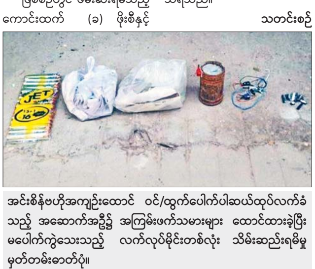
အင်းစိန်ဗဟိုအကျဉ်းထောင် ဝင်/ထွက်ပေါက်ပါဆယ်ထုပ်လက်ခံ သည့် အဆောက်အအုံ၌ အကြမ်းဖက်သမားများ ထောင်ထားခဲ့ပြီး မပေါက်ကွဲသေးသည့် လက်လုပ်မိုင်းတစ်လုံး သိမ်းဆည်းရမိမှု မှတ်တမ်းဓာတ်ပုံ။

“Special Task Agency of Burma (STA) အထူးတာဝန် လုပ်ငန်း အဖွဲ့” အမည်ခံ အကြမ်းဖက်အဖွဲ့က အင်းစိန်အကျဉ်းထောင်ပေါက်ကွဲမှု ဖြစ်စဉ်နှင့်ပတ်သက်၍ ၎င်းတို့အဖွဲ့က လုပ်ဆောင်ခဲ့ခြင်းဖြစ်ကြောင်း ဝန်ခံထွက်ဆိုထားသည့် ကြေညာချက်မှတ်တမ်းဓာတ်ပုံ။