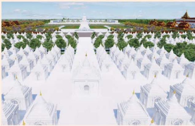
ကျောက်စာရုံစေတီ(၁၂ x ၁၂x ၁၈)ပေ ၁ ဆူ တန်ဖိုး-၂၇၉ သိန်း