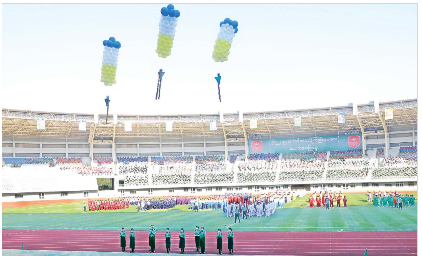
တပ်မတော်အားကစားနှင့် ကာယပညာအုပ်ချုပ်ရေးအဖွဲ့ ဥက္ကဋ္ဌ စစ်ရေးချုပ် ဒုတိယဗိုလ်ချုပ်ကြီး စိုးမင်းဦးနှင့် နေပြည်တော်တိုင်းစစ်ဌာနချုပ် တိုင်းမှူးဗိုလ်ချုပ် ဇော်ဟိန်းတို့က ဖွင့်ပွဲစာတန်းပါ မိုးပျံပူဖောင်းများကို ဖဲကြိုးဖြတ်၍ လွှတ်တင်စဉ်။

ယင်းနောက် နိုင်ငံတော်စီမံအုပ်ချုပ်ရေးကောင်စီဥက္ကဋ္ဌ တပ်မတော်ကာကွယ်ရေးဦးစီးချုပ်သည်