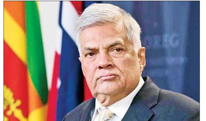
သီရိလင်္ကာသမ္မတ ရာနေးဝစ်ခမီဆင်းဂေးလ်။