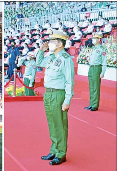
နိုင်ငံတော်စီမံအုပ်ချုပ်ရေးကောင်စီဥက္ကဋ္ဌ တပ်မတော်ကာကွယ်ရေးဦးစီးချုပ် ဗိုလ်ချုပ်မှူးကြီး မင်းအောင်လှိုင် စစ်ရေးပြပွဲများကြီး ဦးဆောင်သော အလံတော်အဖွဲ့နှင့် အားကစားသမားများ၏ အလေးပြုခြင်းကို ခံယူစဉ်။