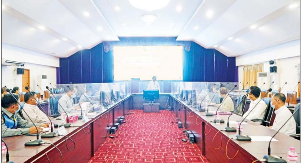
ရှင်းလင်းတင်ပြရာအဖွဲ့ဝင်များက တိုင်းဒေသကြီး အတွင်းရှိ ဟိုတယ်နှင့်ခရီးသွားလုပ်ငန်းကဏ္ဍ စနစ် တကျဖြင့် ရေရှည်ဖွံ့ဖြိုးတိုးတက်နိုင်ရေးအတွက် အကြံပြုဆွေးနွေးခဲ့ကြပြီး တိုင်းဒေသကြီးဝန်ကြီး ချုပ်က ဆွေးနွေးတင်ပြချက်များအပေါ် ညှိနှိုင်း ဆောင်ရွက်ပေးခဲ့ကြောင်း သိရသည်။ သတင်းစဉ်

ဆက်လက်၍ ကော်မတီအတွင်းရေးမှူးက ယခင် အစည်းအဝေး ဆုံးဖြတ်ချက်များအပေါ် ဆောင်ရွက် ပြီးစီးမှုအခြေအနေများနှင့် ကော်မတီမှဆုံးဖြတ်ပေးရ မည့် ဝန်ဆောင်မှုကဏ္ဍအလိုက် လုပ်ငန်းလိုင်စင် လျှောက်ထားခြင်းဆိုင်ရာ အမှာစာများအား