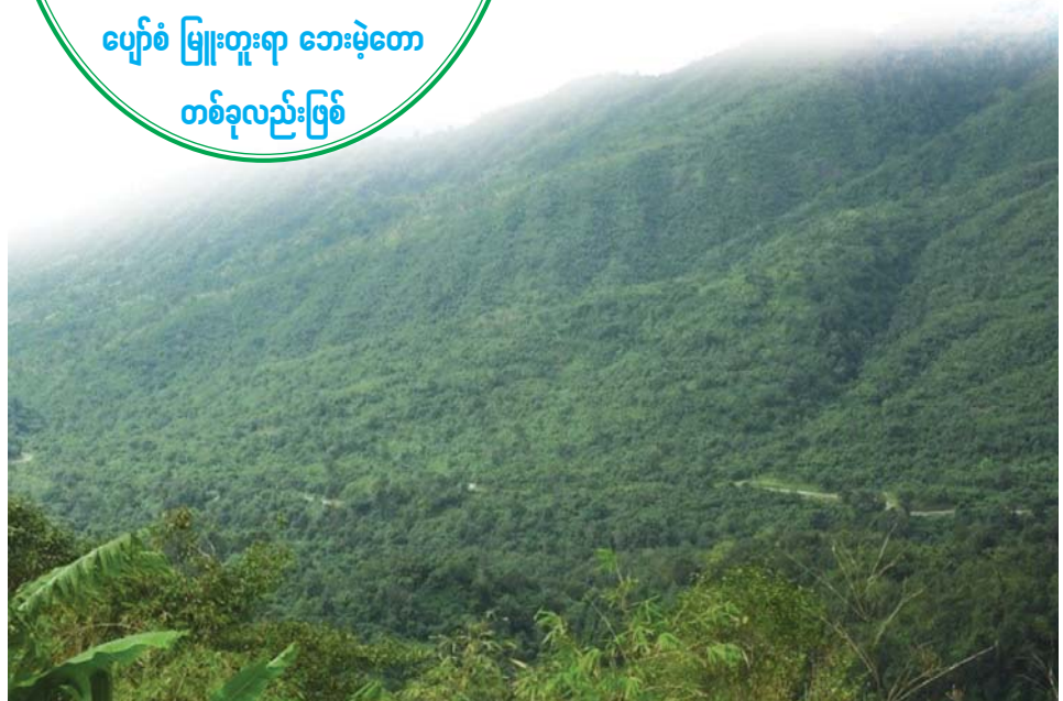
ကျိုက်ထီးရိုးသဘာဝနယ်မြေထိန်းသိမ်းရေး ဘေးမဲ့တောနှင့် သဘာဝရေထွက်စမ်းချောင်းကို တွေ့ရစဉ်။