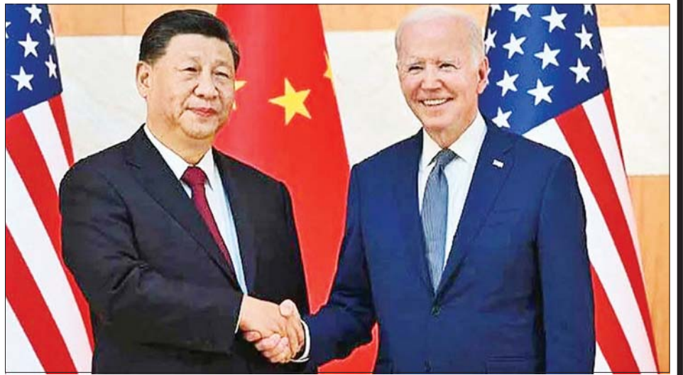
တရုတ်သမ္မတရှီကျင့်ဖျင်နှင့် အမေရိကန်သမ္မတ ဂျိုးဘိုင်ဒင်။