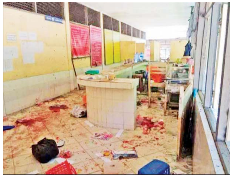
အင်းစိန်ဗဟိုအကျဉ်းထောင် ဝင်/ထွက်ပေါက် ပါဆယ်ထုပ်လက်ခံသည့် အဆောက်အဦအား အကြမ်းဖက်သမားများက လက်လုပ်မိုင်းဖြင့် ဖောက်ခွဲတိုက်ခိုက်ခဲ့သည့်အတွက် ပေါက်ကွဲမှုဖြစ်ပွားခဲ့သည့် မှတ်တမ်းဓာတ်ပုံများ။