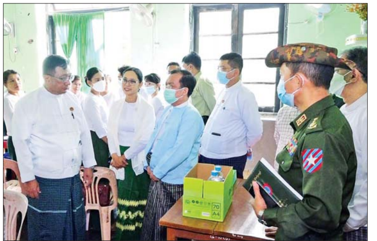
ချီးမြှင့်ထောက်ပံ့ပေးမှုများ ပေးအပ်၍ ဆရာ များဖြင့် လက်တွေ့ သရုပ်ပြသင်ကြား ဆရာမများအား ရင်းရင်းနှီးနှီး လိုက်လံ ပြသနေမှုကို ကြည့်ရှုအားပေးခဲ့သည်။ နှုတ်ဆက်ကာ သင်ထောက်ကူပစ္စည်း ခင်စန်းမြင့် (ပြန်/ဆက်)

ပညာရေးအခန်းကဏ္ဍကို ဖော်ဆောင် ပေးနိုင်ရန် ဆောင်ရွက်ကြစေလို ကြောင်း အမှာစကား ပြောကြား သည်။ ထို့နောက် မော်လမြိုင်တက္ကသိုလ် ပါမောက္ခချုပ် ဒေါက်တာအောင်မြတ် ကျော်စိန်က အခြေခံပညာအထက်တန်း အဆင့်တွင် သိပ္ပံဘာသာရပ်များအတွက် သင်ထောက်ကူပစ္စည်းများ လက်တွေ့ အသုံးချ၍ စာတွေ့၊ လက်တွေ့ သင်ကြား ပို့ချပေးနိုင်ရေး ဆောင်ရွက်ထားရှိမှု အခြေအနေကိုလည်းကောင်း၊ ပြည်နယ် ပညာရေးမှူး ဒေါက်တာချိုချို မြတ်အောင် က သင်တန်းရေးရာကိစ္စရပ်များကို လည်းကောင်း ရှင်းလင်းတင်ပြခဲ့ကြပြီး ပြည်နယ်ဝန်ကြီးချုပ်က သင်တန်းအတွက်