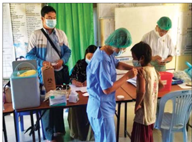
ကျောင်းသား ကျောင်းသူများကို ကိုဗစ်-၁၉ ရောဂါ ကာကွယ်ဆေး ထိုးနှံပေးစဉ်။