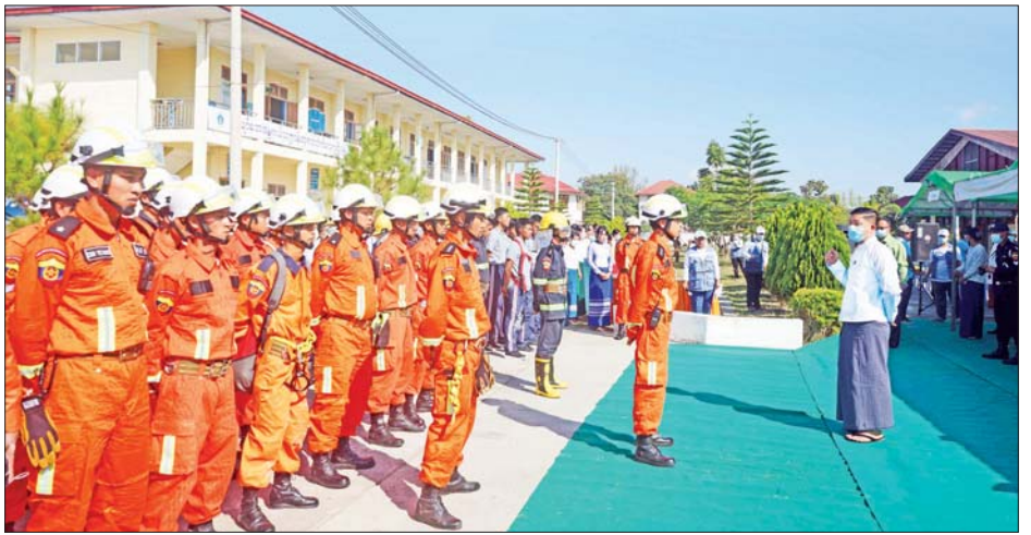
စေရန်အတွက် ရေမှန်ရေမွှားဖျန်းခြင်းစသည် ကြက်ခြေနီတပ်ဖွဲ့၊ ဝန်ထမ်းများ၊ နည်းပြများ၊ ဆရာမ တို့ကို အားကစားနှင့်ကာယပညာသိပ္ပံ (လွိုင်ကော်) ကျောင်းရှိ စာသင်ဆောင်နှင့် အိပ်ဆောင်အတွင်း၌ မီးသတ်တပ်ဖွဲ့၊ ကျန်းမာရေးစောင့်ရှောက်မှုအဖွဲ့၊

ထို့နောက် ငလျင်ဘေးအန္တရာယ် သင်တန်းတို့ လေ့ကျင့်မှုများဖြစ်သည့် မြေငလျင်လှုပ်ခတ်၍ သတိ ပေးခရာသိမြင်ခြင်း၊ ဘေးကင်းလုံခြုံအောင် နေရာ ယူခြင်း၊ ဦးဆောင်သူခေါင်းဆောင်များက အသိပေး နှိုးဆော်ခြင်း၊ အဆောက်အအုံအတွင်းမှ ဘေးလွတ် ကင်းသည့်နေရာသို့ ထွက်ခွာခြင်း၊ ရှာဖွေကယ်ဆယ် ရေးတပ်ဖွဲ့ဝင်များက ဘေးအန္တရာယ်ကျရောက်ရာ နေရာသို့ရောက်ရှိ ကယ်ဆယ်ခြင်း၊ ထိခိုက်ဒဏ်ရာ ရရှိသူများကို ရှေးဦးသူနာပြုစုပေးခြင်းနှင့် ဆေးကုသ ပေးခြင်း၊ ယာယီခိုလှုံရာ ကယ်ဆယ်ရေးစခန်းသို့ နေရာချထားပေးခြင်း၊ စားစရာဝေငှခြင်း၊ မီးမလောင်