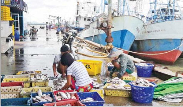
ငါးဖမ်းသင်္ဘောများပေါ်မှ ငါးများကို ဆိပ်ကမ်း၌ သယ်ချ၍ ရောင်းချနေစဉ်။