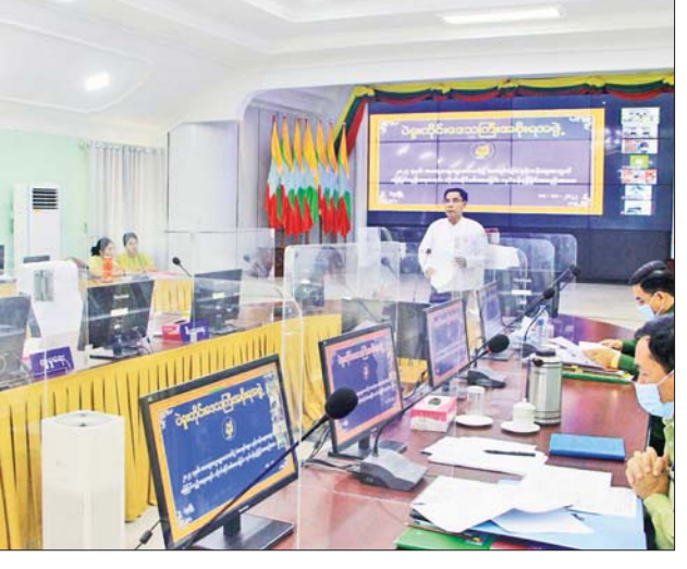
မြို့နယ်အလိုက် မဲစာရင်းမှန်ကန်စေရေး လည်းကောင်း ရှင်းလင်းတင်ပြကာ တိုင်း အတွက် Working Group အလိုက် ဖြန့်ခွဲ ဒေသကြီး ဝန်ကြီးချုပ်က လိုအပ်သည်များ မှာကြားခဲ့သည်။ တင်စိုး(ပဲခူး)

ထို့နောက် တိုင်းဒေသကြီး လူမှု ရေးရာဝန်ကြီးက တိုင်းဒေသကြီးအတွင်း အိမ်ထောင်စုစာရင်းပုံစံ (၆၆/၆) ကို အခြေခံ၍ မဲစာရင်းမှန်ကန်စေရေးအတွက် မြေပြင်လူဦးရေစာရင်း တိုက်ဆိုင်စစ်ဆေး ကောက်ယူခြင်း ဆောင်ရွက်မည့်လုပ်ငန်း စဉ်များကို လည်းကောင်း၊ ပဲခူးတိုင်းဒေသ ကြီး ရွေးကောက်ပွဲကော်မရှင်း တာဝန်ခံ အရာရှိက မဲစာရင်းဆိုင်ရာအချက်အလက် များကိုလည်းကောင်း၊ ခရိုင်စီမံအုပ်ချုပ် ရေးအဖွဲ့ဥက္ကဋ္ဌများက ခရိုင်အတွင်း