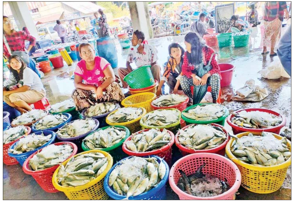
လက်ရှိ မြိတ်မြို့အပြည်ပြည်ဆိုင်ရာ အဆင့်မီ ငါးလေလံဈေး၌ ဈေးရောင်းချနေသူများ။

“ငါးလေလံဈေးကို စတင် တည်ဆောက်ကတည်းက ထိုင်း ရောက်နေတဲ့ ငါးဈေးကွက်ကို မြန်မာနိုင်ငံကို ပြန်ရောက်အောင် လုပ်ဖို့ အလုပ်အကိုင်အခွင့်အလမ်း တွေရရှိဖို့ နိုင်ငံတော်ကရသင့်ရ ထိုက်တဲ့ အခွန်အခတွေမုန့်ကန်စွာ ရရှိဖို့ဆိုပြီး ကျွန်မတို့ရည်ရွယ် ထားခဲ့ပါတယ်။ လွန်ခဲ့တဲ့နှစ်ပေါင်း ၂၀ ကျော်ကတည်းက လုပ်ငန်းရှိ နေခဲ့တာပါ။ ကျွန်မတို့နိုင်ငံက သယံဇာတတွေကို ထိုင်းနိုင်ငံထဲ အထိ ကုန်ကြမ်းအဆင့်နဲ့ ပို့နေရ သလို လုပ်သားတွေလည်း သွား ရောက်လုပ်ကိုင်နေရတယ်။ မြန်မာ နိုင်ငံမှာငါးဈေးကွက် ပြန်ရောက် လာဖို့ အစိုးရကလည်း ကူညီ ပံ့ပိုးမယ်၊ လုပ်ငန်းရှင်တွေအနေ နဲ့လည်း အမှန်တကယ် လုပ် ဆောင်ကြမယ်ဆိုရင် ကျွန်မတို့ အနေနဲ့ ပူးပေါင်းဆောင်ရွက်ဖို့ အဆင်သင့်ပါပဲ။ ကျွန်မတို့ပူးပေါင်း ဆောင်ရွက်သွားမယ်ဆိုရင် ငါး ဈေးကွက် မြန်မာနိုင်ငံကို သေချာ ပေါက်ပြန်ရောက်လာမှာပါ။ မြေ ဧက ၁၀၀ ကျော်အပေါ်မှာ အခြေခံ အဆောက်အအုံတွေ၊ အအေးခန်း တွေ၊ ကုန်ချောစက်ရုံတွေ အများ ကြီး ရင်းနှီးမြှုပ်နှံလို့ရပါတယ်။ ကျွန်မတို့အနေနဲ့ ပူးပေါင်း