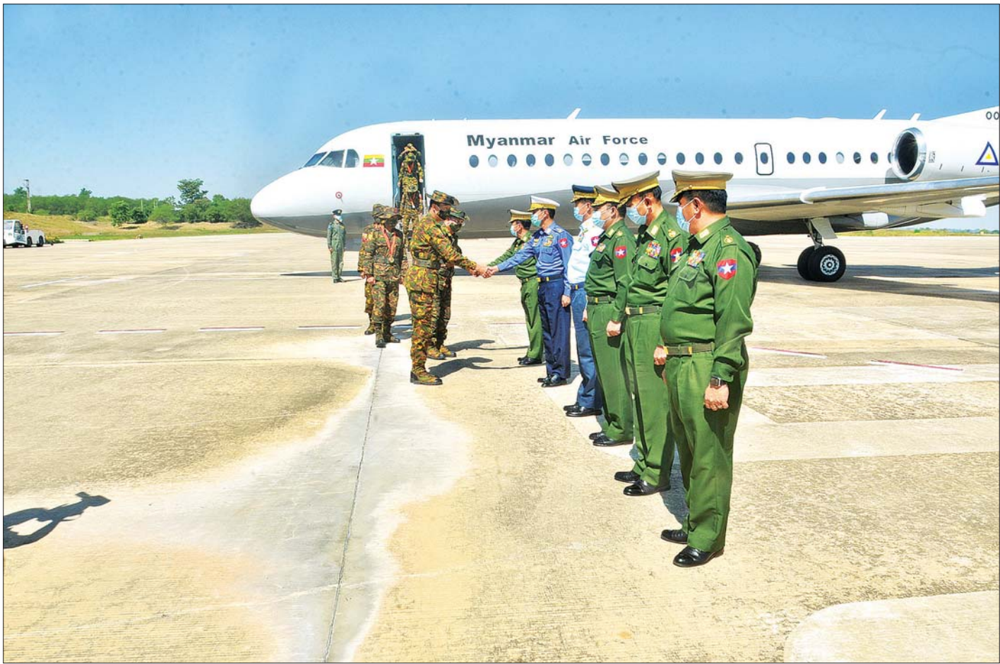
မြန်မာ့တပ်မတော် သေနတ်ပစ်အသင်း နေပြည်တော်သို့ ပြန်လည်ရောက်ရှိရာ ကာကွယ်ရေးဦးစီးချုပ်ရုံး (ကြည်း) မှ ဒုတိယဗိုလ်ချုပ်ကြီး သန်းထွန်းဦးနှင့် တပ်မတော်အရာရှိကြီးများက ကြိုဆိုနှုတ်ဆက်ကြစဉ်။

နေပြည်တော် နိုဝင်ဘာ ၁၃ အကြိမ် (၃၀) မြောက် အာဆီယံနိုင်ငံတပ်မတော် (ကြည်း) များ သေနတ်ပစ်ပြိုင်ပွဲ (AARM-30) ကို နိုဝင်ဘာ ၄ ရက်မှ ၁၁ ရက်အထိ ဗီယက်နမ်နိုင်ငံတွင် ကျင်းပခဲ့ပြီး မြန်မာ့တပ်မတော် သေနတ်ပစ်အသင်း ဝင်ရောက်ယှဉ်ပြိုင်ခဲ့သည်။ မြန်မာ့တပ်မတော် သေနတ်ပစ်အသင်းတွင် အသင်းခေါင်းဆောင် ဒုတိယဗိုလ်မှူးကြီး သိန်းစိုးထွန်း၊ ဦးဆောင်၍ အုပ်ချုပ်သူ၊ နည်းပြများနှင့် သေနတ်ပစ် အားကစားသမား စုစုပေါင်း ၄၂ ဦး ပါဝင်ခဲ့ကြပြီး ပစ္စည်းအမျိုးသားအသင်း၊ ပစ္စည်းအမျိုးသမီးအသင်း၊ ကာဘိုင်းအမျိုးသားအသင်း၊ ရိုင်ဖယ်အမျိုးသားအသင်းနှင့် စက်သေနတ်အမျိုးသားအသင်းတို့ ဝင်ရောက် ယှဉ်ပြိုင်ကစားခဲ့ကြရာ အသင်းလိုက် အမှတ်ပေးပြိုင်ပွဲတွင် ရွှေတံဆိပ် ခြောက်ခု၊ ငွေတံဆိပ် ခြောက်ခု၊ ကြေးတံဆိပ် လေးခု၊ ထိလဲပြား ပစ်ခတ်စဉ်ပြိုင်ပွဲတွင် ရွှေတံဆိပ် ခြောက်ခု၊ ငွေတံဆိပ် ခြောက်ခု၊ ကြေးတံဆိပ် လေးခုတို့ရရှိခဲ့ပြီး စုစုပေါင်း ရွှေတံဆိပ် ၁၂ ခု၊ ငွေတံဆိပ် ၁၂ ခု၊ ကြေးတံဆိပ် ရှစ်ခုဆွတ်ခူးရရှိခဲ့ကာ နိုင်ငံအလိုက် စတုတ္ထအဆင့်တွင် ရပ်တည်နိုင်ခဲ့သည်။ ပြိုင်ပွဲတွင် လာအိုတပ်မတော်မှ သေနတ်ပစ်အသင်းအနေဖြင့် မြန်မာ့တပ်မတော် သေနတ်ပစ်အသင်းနည်းတူ ဆုတံဆိပ်ရရှိမှုများ တူညီခဲ့သော်လည်း ရိုင်ဖယ်ပစ်ခတ်စဉ်ပြိုင်ပွဲ အမှတ်ပေးပွဲစဉ် (၁) စာမျက်နှာ ၃ ကော်လံ ၁၂