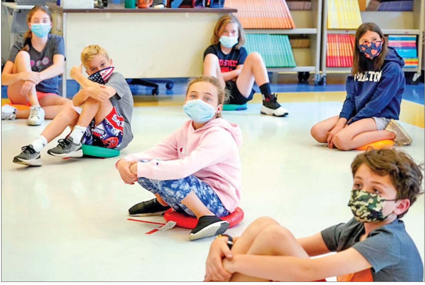
နယူးယောက်မြို့ရှိ စာသင်ကျောင်းတွင် ကလေးများ ပါးစပ်နှာခေါင်းစည်း တပ်ဆင်ထားသည်ကို တွေ့ရစဉ်။

ပါးစပ် နှာခေါင်းစည်း တပ်ဆင်ဖို့ ကန့်သတ်ချက်ကို ဖယ်ရှားပေးလိုက်တဲ့ စာသင်ကျောင်းနယ်မြေမှာဆိုရင် ၁၅ ပတ်အတွင်း ကျောင်းသား ၁၀၀၀ လျှင် ကူးစက်မှုနှုန်းမှာ ၁၃၄ ဒဿမ ၄ ရှိပြီး ပါးစပ် နှာခေါင်းစည်းတပ်ဆင်ထားတဲ့ နယ်မြေကျောင်းမှာတော့ ကူးစက်မှုနှုန်းဟာ ၁၀၀၀ မှာ ၆၆ ဒဿမ ၁ ရှိတယ်လို့ လေ့လာမှုအရ တွေ့ရှိရပါတယ်။ ပါးစပ်နှာခေါင်းစည်း တပ်ဆင်ရမယ့်အမိန့်ကို ဖယ်ရှားလိုက်ခြင်းကြောင့် ကိုဗစ်-၁၉ ကူးစက်မှုနှုန်း ဦးရေဟာ ပိုပြီးတိုးလာတယ်ဆိုတာကို တွေ့ရှိရပါတယ်။ ဝန်ထမ်းတွေနဲ့