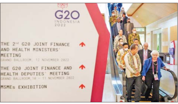
အမေရိကန်ဘဏ္ဍာရေးဝန်ကြီး ဂျနက်ယဲလ်လင်း။

ဘာလီ နိုဝင်ဘာ ၁၃ ဂျီ - ၂၀ ကျန်းမာရေးနှင့် ဘဏ္ဍာရေးဝန်ကြီးများသည် နောင်တွင် ဖြစ်ပေါ်လာမည့် ကမ္ဘာ့ကပ်ရောဂါကို ကိုင်တွယ်ဖြေရှင်းရန်အတွက် နိုဝင်ဘာ ၁၃ ရက်တွင် ကပ်ရောဂါရန်ပုံငွေအမေရိကန်ဒေါ်လာ ၁ ဒသမ ၄ ဘီလီယံကို စတင်ထူထောင်ခဲ့ကြောင်း အေအက်ဖ်ပီက ဖော်ပြသည်။ ဖြစ်ပေါ်လာမည့် ကပ်ရောဂါကို ကာကွယ်ရန်နှင့် ကြိုတင်ပြင်ဆင်