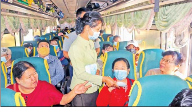
အလားတူ ကျိုင်းတုံမြို့နယ်၌ လူစည်ကားရာနေရာများ၊ ဈေးများ တွင် အပြင်ထွက်သွားလာသူများအား နှာခေါင်းစည်းများ အခမဲ့ဖြန့်ဝေ ခြင်းနှင့် ကိုဗစ်-၁၉ ရောဂါကာကွယ်ရေး ကျန်းမာရေးအသိပညာပေး နှိုးဆော်ခြင်းများကို ဆက်လက်ဆောင်ရွက်သွားမည်ဖြစ်ကြောင်း သိရ အောင်ဇင်မြင့်(ပြန်/ဆက်)

ကျိုင်းတုံ နိုဝင်ဘာ ၁၃ ရှမ်းပြည်နယ်(အရှေ့ပိုင်း) ကျိုင်းတုံမြို့အဝင် နောင်နှမ်း ပူးပေါင်းစစ်ဆေး ရေးဂိတ်၌ ကိုဗစ်-၁၉ ရောဂါ ကြိုတင်ကာကွယ်ရေး နှာခေါင်းစည်းများ အခမဲ့ဖြန့်ဝေခြင်းကို နိုဝင်ဘာ ၁၁ ရက်က ပြုလုပ်သည်။ မြို့နယ်အထွေထွေအုပ်ချုပ်ရေးဦးစီးဌာန ဝန်ထမ်းများ၊ စည်ပင် သာယာရေးဌာနဝန်ထမ်းများ၊ တပ်မတော်သားများ၊ ရဲတပ်ဖွဲ့ဝင်များ၊ မီးသတ်တပ်ဖွဲ့ဝင်များ၊ ကျန်းမာရေးဝန်ထမ်းများ၊ ပူးပေါင်းစစ်ဆေးရေး ဂိတ်မှ တပ်ဖွဲ့ဝင်များနှင့် ဌာနဆိုင်ရာများက ကျိုင်းတုံမြို့အတွင်းသို့ ဝင်ရောက်လာသည့် ခရီးသွားပြည်သူများ၊ အပြင်ထွက်သွားလာသူများ အား ကိုဗစ်-၁၉ ရောဂါ ကြိုတင်ကာကွယ်ရေးအတွက် နှာခေါင်းစည်းများ အခမဲ့ဖြန့်ဝေပေးခဲ့ပြီး စနစ်တကျတပ်ဆင်ရန်နှင့် ကျန်းမာရေးဝန်ကြီး ဌာနမှ ထုတ်ပြန်ထားသည့် ကိုဗစ်-၁၉ ရောဂါ ကြိုတင်ကာကွယ်ရေး နည်းလမ်းများကို တိကျစွာလိုက်နာကြရန် အသိပညာပေး ပြောကြား ခြင်းများ ဆောင်ရွက်ခြင်းဖြစ်သည်။