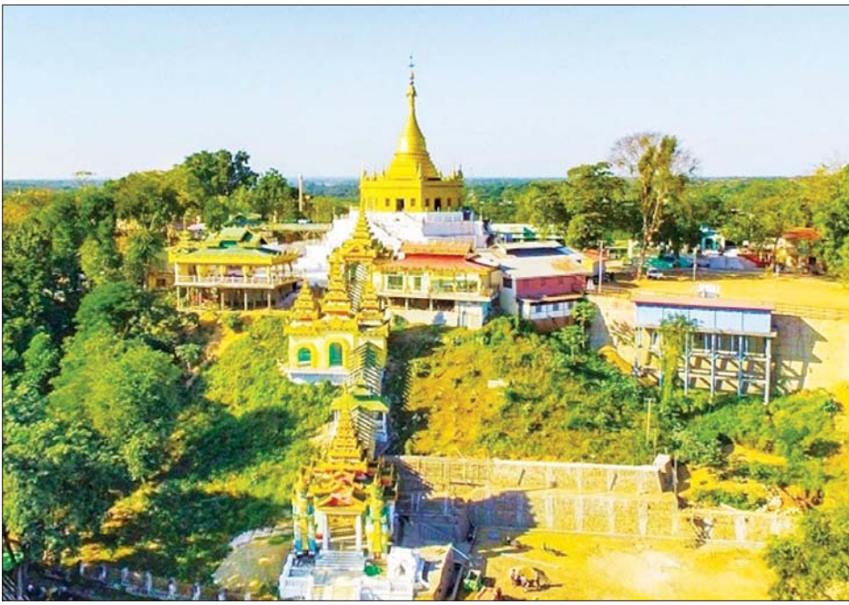
သမိုင်းဝင် ရှင်ပင်စက္ကိန်းတဲ စေတီတော်မြတ်ကြီး။