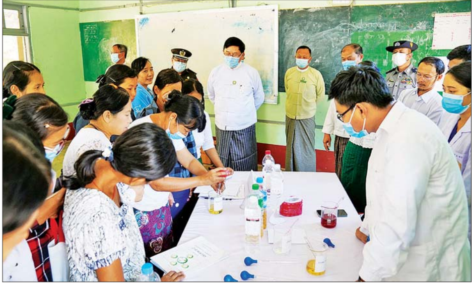
ကျောင်းသူများအား သင်ကြားပို့ချရာတွင် ဆရာ ဆရာမများ၏ အရည်အသွေးများကို ပိုမိုမြှင့်တင်ပေး ရန် ရည်ရွယ်ကာ တစ်ဘာသာလျှင် နှစ်ရက်နှုန်းဖြင့် သင်တန်းဖွင့်လှစ်ပို့ချခြင်းဖြစ်ကြောင်း၊ အခြေခံ ပညာကျောင်းများမှ ဆရာ ဆရာမများသာမက ကိုယ်ပိုင်ကျောင်းများမှ ဆရာ ဆရာမများသည်

မကွေး နိုဝင်ဘာ ၁၃ ပညာရေးဝန်ကြီးဌာန အခြေခံပညာဦးစီးဌာန မကွေး တိုင်းဒေသကြီးပညာရေးမှူးရုံးကကျင်းပသော ၂၀၂၂-၂၀၂၃ ပညာသင်နှစ် အခြေခံပညာအထက်တန်းဆင့် သင် ဆရာ ဆရာမများအား သင်ထောက်ကူပစ္စည်း များ လက်တွေ့အသုံးချသင်ကြားနိုင်ရေး အရည် အသွေးမြှင့် မွမ်းမံသင်တန်းဖွင့်ပွဲကို နိုဝင်ဘာ ၁၂ ရက်က မကွေးမြို့ အမှတ် (၁) အခြေခံပညာ အထက်တန်းကျောင်း ပန်းတောင်ခန်းမ၌ ကျင်းပ သည်။