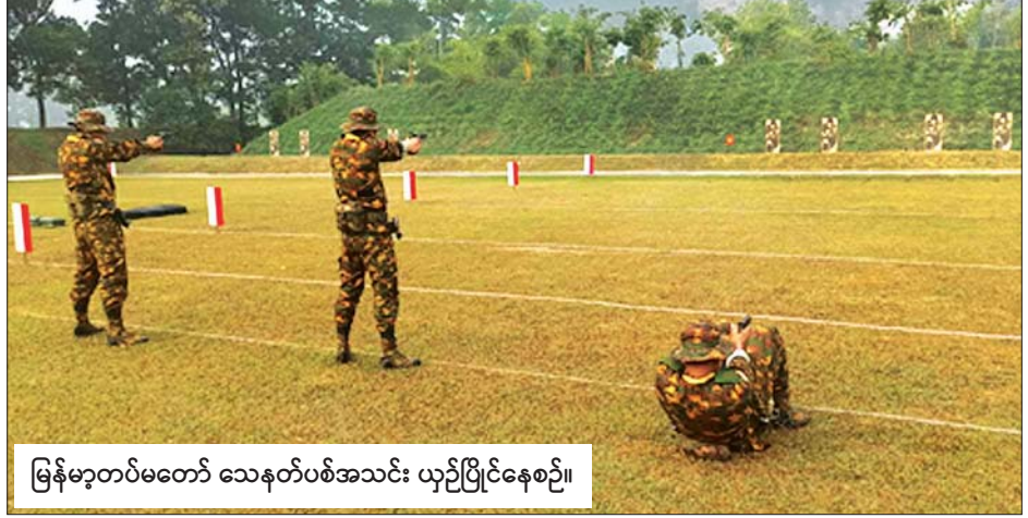
မြန်မာ့တပ်မတော် သေနတ်ပစ်အသင်း ယှဉ်ပြိုင်နေစဉ်။