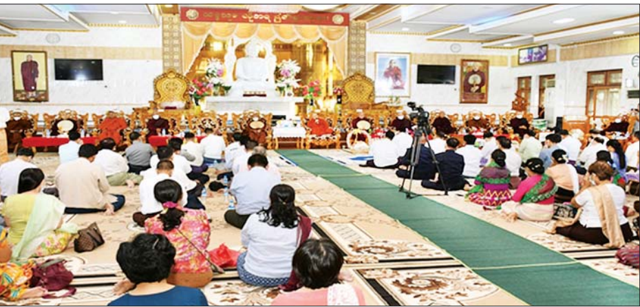
ပေးအပ်လှူဒါန်းခဲ့ပြီး စာမေးပွဲပြုဆိုင်ရာရက်များ ရေး ညှိနှိုင်းဆွေးနွေးခဲ့ကြကြောင်း သတင်းရရှိ တွင် သံဃာတော်များ၏ ဆွမ်းကိစ္စ၊ ကျန်းမာရေး သည်။ နှင့် အခြားလိုအပ်သည့် ကိစ္စရပ်များ ဆောင်ရွက်နိုင် သတင်းစဉ်

ဦးစွာ တိုင်းဒေသကြီးဝန်ကြီးချုပ်၊ တိုင်းမှူးနှင့် တက်ရောက်လာကြသူများက အင်းစိန်မြို့နယ် ရွာမပရိယတ္တိစာသင်တိုက်ကြီး၏ ဦးစီးပဓာန နာယကဆရာတော်ထံမှ ငါးပါးသီလခံယူ ဆောက်တည်ကြသည်။ ထို့နောက် မဇ္ဈိမဂုဏ်ရည် ဆရာတော်ဘဒ္ဒန္တကောဝိဒက အစည်းအဝေးကျင်းပရခြင်းနှင့် စပ်လျဉ်း၍ လျှောက်ထားမိန့်ကြားသည်။ ယင်းနောက် တိုင်းဒေသကြီးဝန်ကြီးချုပ်က သာသနာရေးဆိုင်ရာများ လျှောက်ထားပြီး တိုင်းမှူး၊ တာဝန်ရှိသူများနှင့်အတူ သံဃာတော်များအား လှူဖွယ်ဝတ္ထုပစ္စည်းများ ဆက်ကပ်လှူဒါန်းကြသည်။ ထို့နောက် တိုင်းဒေသကြီးဝန်ကြီးချုပ်နှင့် တိုင်းမှူးတို့က တိုင်းဒေသကြီးအစိုးရအဖွဲ့နှင့် တိုင်းစစ်ဌာနချုပ်တို့မှ လှူဒါန်းသော အလှူငွေများအား စာမေးပွဲကျင်းပရေးကော်မတီဥက္ကဋ္ဌထံ