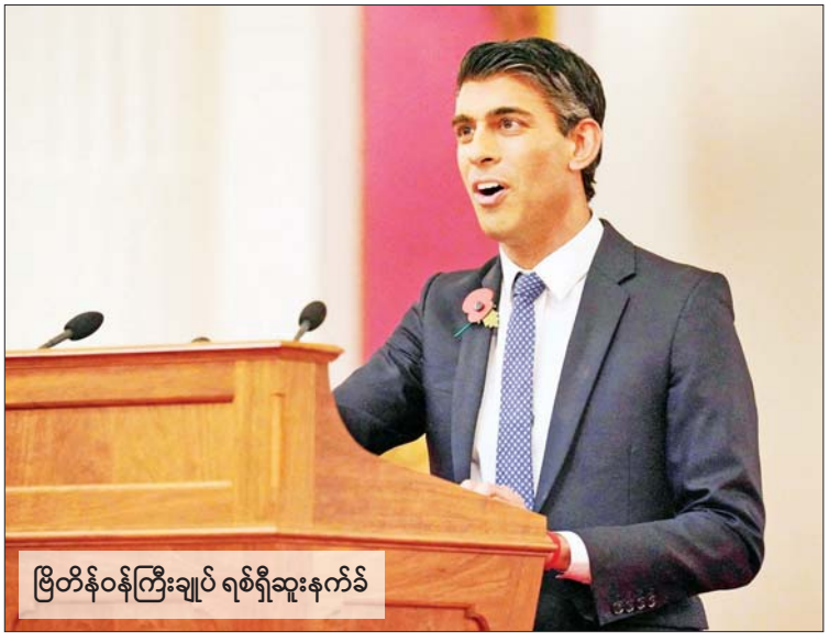
ဗြိတိန်ဝန်ကြီးချုပ် ရစ်ရှီဆူးနက်

ဆူးနက်၏ ပြောရေးဆိုခွင့်ရှိသူက အစ္စရေးနိုင်ငံရှိ ပါတီများအားလုံးကို ဖောင်းပွစေသည့်စကားများ မပြောဘဲ ရှောင်ကြဉ်ကြရန်နှင့် သည်းခံနိုင်မှုကို ပြသရန်၊ လူနည်းစုအုပ်စုများအပေါ်လေးစားရန် နိုဝင်ဘာ ၇ ရက်က တိုက်တွန်းပြောကြားလိုက်သည်။ အေအက်ဖ်ပီ