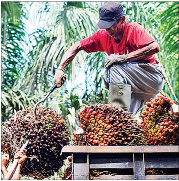
စီးပွားရေးတိုးတက်မှုနှုန်း ခန့်မှန်းတွက်ချက်ရာတွင် အစိုးရ၏ ခန့်မှန်းချက်မှာ ၅ ဒသမ ၇ ရာခိုင်နှုန်းရှိပြီး ဗဟိုဘဏ်က ၅ ဒသမ ၅ ရာခိုင်နှုန်းရှိကြောင်း သိရသည်။ ဆင်ယွာ

ကျာတာ နိုဝင်ဘာ ၇ အင်ဒိုနီးရှားနိုင်ငံ၏စီးပွားရေးသည် ယခုနှစ် ပထမသုံးလအတွင်း ကုန်ပစ္စည်းများ၏ တင်ပို့မှု မြင့်တက်လာပြီးနောက် တစ်နှစ်ထက်တစ်နှစ် ၅ ဒသမ ၇၂ ရာခိုင်နှုန်းတိုးလာကြောင်း အင်ဒိုနီးရှားစာရင်းအင်း(ဘီပီအက်စ်)က နိုဝင်ဘာ ၇ ရက်တွင် ပြောကြားသည်။ အဆိုပါ ပမာဏမှာ ဒုတိယသုံးလပတ်၏စီးပွားရေးတိုးတက်မှုထက် ၅ ဒသမ ၄၄ ရာခိုင်နှုန်းပိုများပြီး ၂၀၂၁ ခုနှစ် ဇူလိုင်လမှ စက်တင်ဘာလအတွင်းကထက် ၃ ဒသမ ၅၁ ရာခိုင်နှုန်း ပိုများကြောင်း ဘီပီအက်စ်၏အကြီးအကဲဖြစ်သူ မာဂိုယူပိုနိုက ပြောကြားသည်။ အင်ဒိုနီးရှားနိုင်ငံ၏စီးပွားရေးသည် ပြန်လည်ဦးမော့လာပြီး အားကောင်းလာကြောင်း ၎င်းက သတင်းစာရှင်းလင်းပွဲတစ်ခုတွင် ပြောကြားသည်။ အင်ဒိုနီးရှားနိုင်ငံသည် ကျောက်မီးသွေး၊ စားအုန်းဆီနှင့် သံမဏိအပါအဝင် အခြားကုန်ပစ္စည်း တိုးမြှင့်တင်ပို့ခြင်းကြောင့် နိုင်ငံ၏ ကုန်သွယ်မှုလက်ကျန်မှာ ပထမသုံးလအတွင်း ၁၂ ဒသမ ၅၈ ရာခိုင်နှုန်းတိုးလာကြောင်း သိရသည်။ ပထမသုံးလပတ်အတွင်း