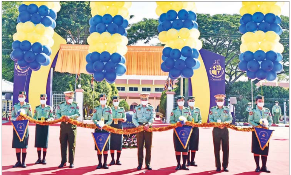
(၇၅) နှစ်မြောက် စိန်ရတု ထောက်ပံ့နှင့် ပို့ဆောင်ရေးတပ်ဖွဲ့နေ့အခမ်းအနားကို ကာကွယ်ရေးဦးစီးချုပ်ရုံး (ကြည်း) မှ စစ်ထောက်ချုပ် ဒုတိယဗိုလ်ချုပ်ကြီး ကျော်စွာလင်း၊ ထောက်ပံ့နှင့်ပို့ဆောင်ရေးညွှန်ကြား ရေးမှူး ဗိုလ်ချုပ် ဝင်းမြတ်နှင့် တိုင်းမှူး ဗိုလ်ချုပ် ဇော်ဟိန်း တို့က ဖဲကြိုးဖြတ်ဖွင့်လှစ်ပေးစဉ်။