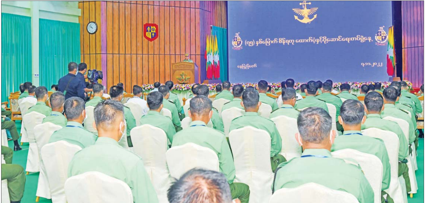
နိုင်ငံတော်စီမံအုပ်ချုပ်ရေးကောင်စီ ဒုတိယဥက္ကဋ္ဌ ဒုတိယတပ်မတော်ကာကွယ်ရေးဦးစီးချုပ် ကာကွယ်ရေးဦးစီးချုပ် (ကြည်း) ဒုတိယဗိုလ်ချုပ်မှူးကြီး စိုးဝင်း (၇၅) နှစ်မြောက် စိန်ရတု ထောက်ပံ့နှင့်ပို့ဆောင်ရေးတပ်ဖွဲ့နေ့ အခမ်းအနားတွင် ဂုဏ်ပြုအမှာစကားပြောကြားစဉ်။

တပ်မတော်အတွက်လိုအပ်သည့် အုပ်ချုပ် ထောက်ပံ့မှု ကိစ္စရပ်များကို တိုးမြှင့်ဆောင်ရွက်နိုင်ရန်