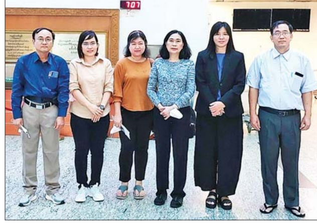
စင်ကာပူနိုင်ငံတွင် ကျင်းပပြုလုပ်မည့် (၇) ကြိမ်မြောက် World One Health Congress 2022 နှင့် တီမာဆက်ဖောင်ဒေးရှင်း ကျန်းမာရေး ပူးပေါင်းဆောင်ရွက်မှုအစည်းအဝေးသို့ တက်ရောက်မည့် မြန်မာ နိုင်ငံမှ ကိုယ်စားလှယ်အဖွဲ့။

၏ ပြည်သူများအတွက် ကဏ္ဍစုံ ကျန်းမာရေး စောင့်ရှောက်မှု လုပ်ငန်းများတွင် များစွာ အထောက်အကူရနိုင်ပြီး အဆိုပါ ကဏ္ဍများ၌ ပူးပေါင်းဆောင်ရွက် နေသူများကိုလည်း အတွေ့အကြုံ ကောင်းများကို ပြန်လည်မျှဝေ ပေးနိုင်မည်ဖြစ်ကြောင်း သိရ သည်။ သတင်းစဉ်