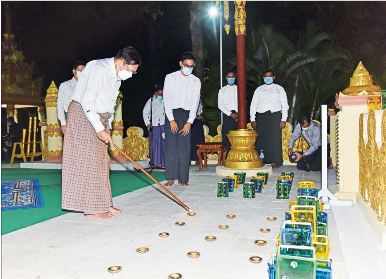
နိုင်ငံတော်စီမံအုပ်ချုပ်ရေးကောင်စီဥက္ကဋ္ဌ တပ်မတော်ကာကွယ်ရေးဦးစီးချုပ် ဗိုလ်ချုပ်မှူးကြီး မင်းအောင်လှိုင် နေပြည်တော်ကောင်စီနယ်မြေ ဇေယျာသီရိမြို့နယ်အတွင်းရှိ ရွှေဘုန်းပွင့်စေတီမြတ်ကြီးအတွင်း ဆီမီး ၁၀၀၀ ထွန်းညှိပူဇော်စဉ်။

အထိမ်းအမှတ်အဖြစ် ကာကွယ်ရေးဦးစီးချုပ်ရုံး (ကြည်း) ဝင်းအတွင်း၌လည်း လမ်း၊ အဆောက်အဦများ၊ ပန်းအလှ သစ်ပင်များတွင် ရောင်စုံမီးအလှများဖြင့် မီးထွန်းပွဲတော်ကို သာယာလှပစွာ ပြုလုပ်ထားရှိပြီး ပျော်ရွှင်ပွဲများကိုလည်း ပြုလုပ်ထားရှိရာ ကာကွယ်ရေးဦးစီးချုပ်ရုံး (ကြည်း) ရေ၊ လေ) မိသားစုများက စိတ်နှလုံးအေးချမ်းစွာဖြင့် ပျော်ရွှင်ကြည်နူးစွာ ဆင်နွှဲခဲ့ကြသည်။ ထိုသို့ တန်ဆောင်တိုင်ပွဲတော် ဆင်နွှဲနေမှုများကို နိုင်ငံတော်စီမံအုပ်ချုပ်ရေးကောင်စီ ဥက္ကဋ္ဌ တပ်မတော် ကာကွယ်ရေးဦးစီးချုပ်နှင့် အဖွဲ့ဝင်များက လှည့်လည်ကြည့်ရှုအားပေးခဲ့ကြသည်။ ပျော်ရွှင်စွာပါဝင်ဆင်နွှဲ ထို့အတူ ရှင်ဥပဂုတ္တမထေရ် မြတ်ပူဇော်ပွဲနှင့် မီးမျှောပူဇော်ပွဲများ၊ တန်ဆောင်တိုင် မီးထွန်းပွဲတော်များကိုလည်း တိုင်းဒေသကြီးနှင့် ပြည်နယ်အသီးသီးရှိ ဘုရား၊ စေတီ၊ ပုထိုးများ၌ ကိုဗစ်-၁၉ စည်းမျဉ်း၊ စည်းကမ်းများနှင့်အညီ ကျင်းပပြုလုပ်ကြရာ