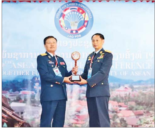
ကာကွယ်ရေးဦးစီးချုပ်(လေ) ဗိုလ်ချုပ်ကြီးထွန်းအောင်ထံသို့ လာအို လေတပ်ဦးစီးချုပ်က ASEAN Air Chief Conference ဥက္ကဋ္ဌ တာဝန်ထမ်းဆောင်မှု လွှဲပြောင်းပေးအပ်စဉ်။

ကာကွယ်ရေး ဝန်ကြီးအား အာဆီယံလေတပ်ဦးစီးချုပ်များ နှင့်အတူ သွားရောက်တွေ့ဆုံ နှုတ်ဆက်ကြသည်။ ဒေသစံတော် ချိန် ညနေ ၆ နာရီခွဲတွင် လာအိုနိုင်ငံ လေတပ်ဦးစီးချုပ်က တည်ခင်းဧည့်ခံသော ဂုဏ်ပြု ညစာစားပွဲသို့ အာဆီယံလေတပ် ဦးစီးချုပ်များနှင့်အတူ တက် ရောက်ခဲ့ကြကြောင်း သတင်းရရှိ သည်။ သတင်းစဉ်