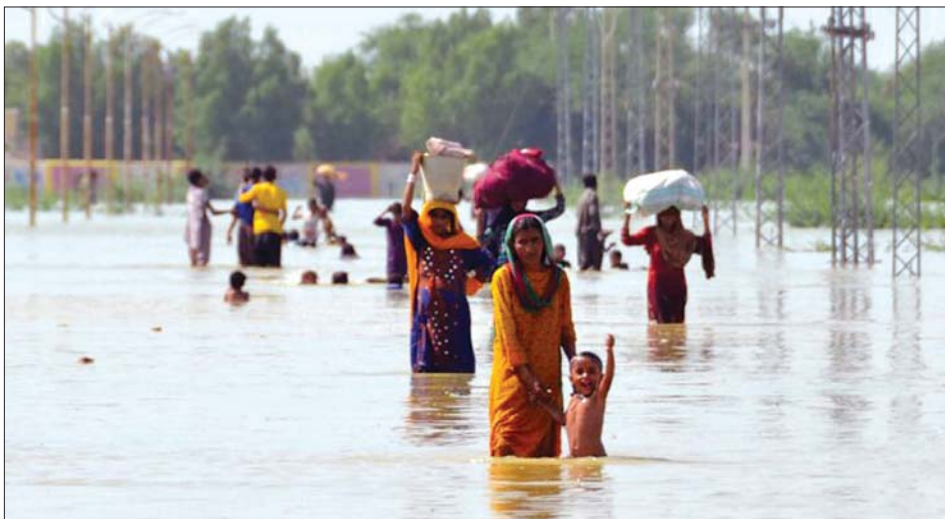
ပါကစ္စတန်ရေကြီးမှုကြောင့် ဘေးလွတ်ရာရွှေ့ပြောင်းကြသူများကို တွေ့ရစဉ်။ (၂၀၂၂ ခုနှစ်အတွင်း ရေကြီးမှုကြောင့် လူပေါင်း ၁၅၀၀ နီးပါးသေဆုံးခဲ့ပြီး လူပေါင်း သန်း ၃၀ နီးပါး ဘေးလွတ်ရာသို့ ရွှေ့ပြောင်းခဲ့ရသည်။)

ကုလသမဂ္ဂပတ်ဝန်းကျင်ဆိုင်ရာ အစီအစဉ် (United Nations Environment Program-UNEP) ၂၀၁၉ အစီရင်ခံစာအရ ၂၀၅၀ ပြည့်နှစ်၌ ကမ္ဘာလူဦးရေမှာ ၁၀ ဘီလီယံအထိ တိုးပွားလာနိုင်သည့်အတွက် စားနပ်ရိက္ခာလိုအပ်မှုမှာ လက်ရှိထက် ၅၀ ရာခိုင်နှုန်းပိုလာနိုင်ခြင်း၊ ကမ္ဘာ့အပူချိန် တိုးတက်မှုမှာလည်း ၂၀၅၀ ပြည့်နှစ်တွင် ၁ ဒီဂရီ ၄ ဒီဂရီဆဲလ်စီးယပ် ပျမ်းမျှအပူချိန်တိုးလာနိုင်သည့်အတွက် ရာသီဥတုပြောင်းလဲမှုဒဏ်ကို ပိုမိုခံစားရနိုင်ခြင်း ဖြစ်လာနိုင်သည်ဟု သိရှိရပါသည်။ အဆိုပါ အစီရင်ခံစာအရ ယနေ့အချိန် ကမ္ဘာလူဦးရေ ၁ ဒီဂရီ ၂ ဘီလီယံမှာ လျှပ်စစ်မီးသုံးစွဲနိုင်မှုမရှိဘဲ လူဦးရေ ၂ ဒီဂရီ ၇ ဘီလီယံသည် ထင်းလောင်စာများကို သုံးစွဲနေရသည်လည်းဖြစ်ပြီး ကမ္ဘာပေါ်ရှိဆင်းရဲသော လူဦးရေ၏ ၇၀ ရာခိုင်နှုန်းမှာ အသက်ရှင်ရပ်တည်ရန် သယံဇာတများအပေါ်တွင် အလွန်အမင်း မူတည်လျက်ရာ ရာသီဥတုပြောင်းလဲမှုကို အလျင်အမြန် မတားဆီးမကာကွယ်နိုင်ပါက ရာသီဥတုပြောင်းလဲမှုကြောင့် ဖြစ်ပေါ်လာမည့် သဘာဝဘေးအန္တရာယ်များနှင့် သဘာဝဘေးအန္တရာယ်များကြောင့် သဘာဝသယံဇာတအရင်းအမြစ်များ ပျက်စီးဆုံးရှုံးမှုများ၊ လူသားများ၏ လူမှုစီးပွား ထိခိုက်ဆုံးရှုံးမှုများကို ကမ္ဘာကြီးပေါ်ရှိလူသားများ ပိုမို ကြုံတွေ့ ခံစားကြရမည်ဖြစ်ပါသည်။ ယနေ့အချိန် ခါတွင်ပင် Extreme weather is a new normal ဟု ဆိုရလောက်အောင် ကမ္ဘာကြီးပေါ်တွင် ရာသီဥတု