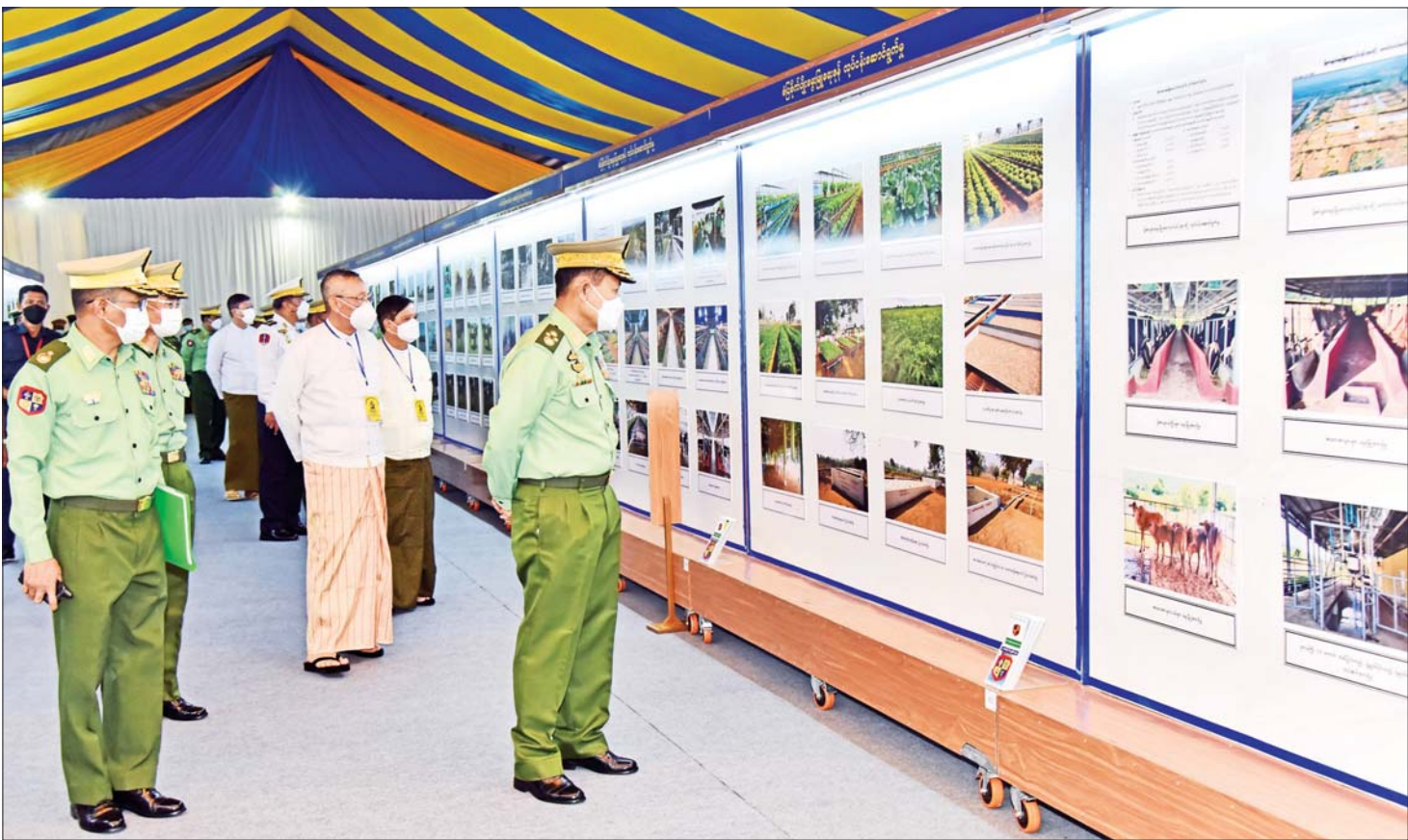
နိုင်ငံတော်စီမံအုပ်ချုပ်ရေးကောင်စီ ဒုတိယဥက္ကဋ္ဌ ဒုတိယတပ်မတော်ကာကွယ်ရေးဦးစီးချုပ် ကာကွယ်ရေးဦးစီးချုပ် (ကြည်း) ဒုတိယဗိုလ်ချုပ်မှူးကြီး စိုးဝင်း (၇၅) နှစ်မြောက် စိန်ရတုထောက်ပံ့နှင့် ပို့ဆောင်ရေးတပ်ဖွဲ့နေ့ အခမ်းအနားသို့ တက်ရောက်ချီးမြှင့်၊ ဂုဏ်ပြုအမှာစကားပြောကြား

နေပြည်တော် နိုဝင်ဘာ ၇ (၇၅) နှစ်မြောက် စိန်ရတုထောက်ပံ့နှင့် ပို့ဆောင်ရေး တပ်ဖွဲ့နေ့ အခမ်းအနားကို ယနေ့နံနက်ပိုင်းတွင် နေပြည်တော်၊ စစ်ကြောရေးနှင့် တည်းခိုရေးစခန်းရှိ ဆင်ဖြူရှင်ခန်းမ၌ ကျင်းပပြုလုပ်ရာ နိုင်ငံတော် စီမံအုပ်ချုပ်ရေးကောင်စီ ဒုတိယဥက္ကဋ္ဌ ဒုတိယ တပ်မတော်ကာကွယ်ရေးဦးစီးချုပ် ကာကွယ်ရေး ဦးစီးချုပ် (ကြည်း) ဒုတိယဗိုလ်ချုပ်မှူးကြီး စိုးဝင်း တက်ရောက်ချီးမြှင့်သည်။ ဖိတ်ကြားထားသူများ တက်ရောက် အဆိုပါ (၇၅)နှစ်မြောက် စိန်ရတုထောက်ပံ့နှင့် ပို့ဆောင်ရေးတပ်ဖွဲ့နေ့အခမ်းအနားသို့ နိုင်ငံတော် စီမံအုပ်ချုပ်ရေးကောင်စီ ဒုတိယဥက္ကဋ္ဌ ဒုတိယ တပ်မတော်ကာကွယ်ရေးဦးစီးချုပ် ကာကွယ်ရေး ဦးစီးချုပ် (ကြည်း)နှင့်အတူ နိုင်ငံတော်စီမံအုပ်ချုပ် ရေးကောင်စီ အတွင်းရေးမှူး၊ နိုင်ငံတော်စီမံအုပ်ချုပ် ရေးကောင်စီအဖွဲ့ဝင်များ၊ ကာကွယ်ရေးဦးစီးချုပ်ရုံး မှ တပ်မတော်အရာရှိကြီးများ၊ နေပြည်တော် တိုင်းစစ်ဌာနချုပ် တိုင်းမှူး၊ အငြိမ်းစားထောက်ပံ့နှင့် ပို့ဆောင်ရေးတပ်ဖွဲ့ဝင် အရာရှိကြီးများ၊ ထောက်ပံ့ နှင့် ပို့ဆောင်ရေးတပ်ဖွဲ့ဝင်များနှင့် ဖိတ်ကြားထား သူများ တက်ရောက်ကြသည်။ စာမျက်နှာ ၄ ကော်လံ ၁ ❖