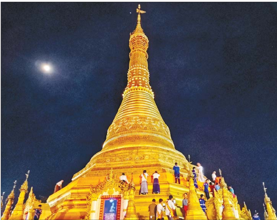
တန်ဆောင်မုန်းလဆန်း ၁၄ ရက်က မုဒုံမြို့ရှိ သမိုင်းဝင် ဆံတော်ရှင်ကန်ကြီး စေတီတော်မြတ်ကြီးအား (၉၆)ကြိမ်မြောက် မသိုးသင်္ကန်းကပ်လှူပူဇော်ကြစဉ်။ သားငယ် (ပြန်/ဆက်)