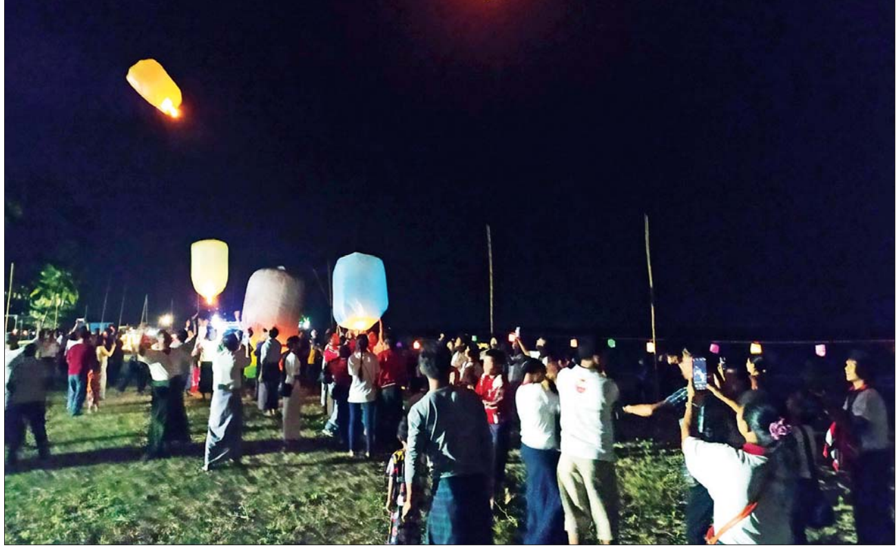
ချောင်းသာကမ်းခြေ၌ တန်ဆောင်မုန်းလပြည့်နေ့တွင် ပြည်သူများဖြင့် စည်ကားနေစဉ်။