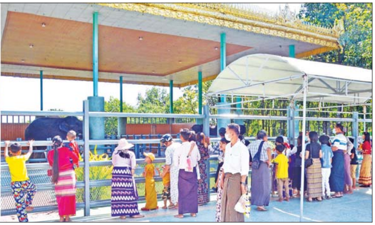
ပျော်ရွှင်ခြင်းကို ဆောင်ကြဉ်းပေး မည့် ဆင်ဖြူရတနာ) ဆင်ဖြူတော် လေး အပါအဝင် အခြားဆင်ဖြူ တော်များနှင့် အဖော်ဆင်များအား သဒ္ဓါကြည်ဖြူစွာဖြင့် အစာလာ ရောက် ကျွေးမွေးကြသူများဖြင့် အထူးစည်ကားလျက်ရှိကြောင်း သတင်းရရှိသည်။(အပေါ်ပုံ) သတင်းစဉ်