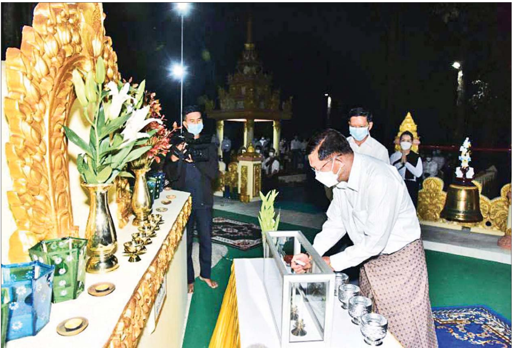
နိုင်ငံတော်စီမံအုပ်ချုပ်ရေးကောင်စီဥက္ကဋ္ဌ တပ်မတော်ကာကွယ်ရေးဦးစီးချုပ် ဗိုလ်ချုပ်မှူးကြီး မင်းအောင်လှိုင် နေပြည်တော်ကောင်စီနယ်မြေ ဇေယျာသီရိမြို့နယ်အတွင်းရှိ ရွှေဘုန်းပွင့်စေတီတော်မြတ်ကြီးအား ဆီမီး၊ ပန်း၊ ရေချမ်းများ ကပ်လှူပူဇော်စဉ်။