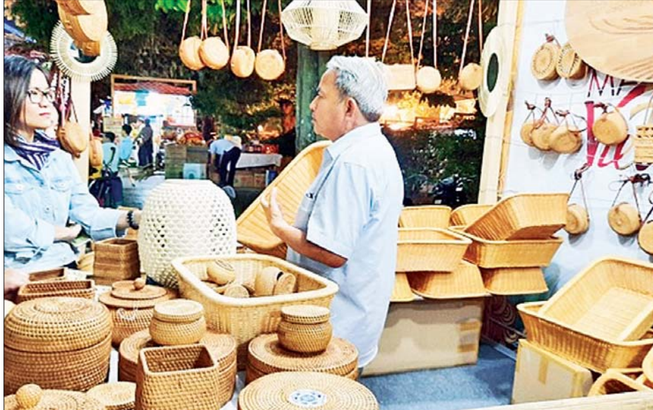
ဆိုးလ်မြို့၌ လမ်းချော်မှုဖြစ်ပွားသည့် ရထားကို တွေ့ရစဉ်။

သစ်အချောထည် ပစ္စည်းများကို တင်သွင်းရာတွင် ဒေါ်လာ ၂ ဒသမ ၆ ဘီလီယံကျော် သုံးစွဲခဲ့ပြီး တစ်နှစ်ထက်တစ်နှစ် ၅ ဒသမ ၉ ရာခိုင်နှုန်း တိုးမြှင့်ခဲ့သည်။ ဆင်ယွာ