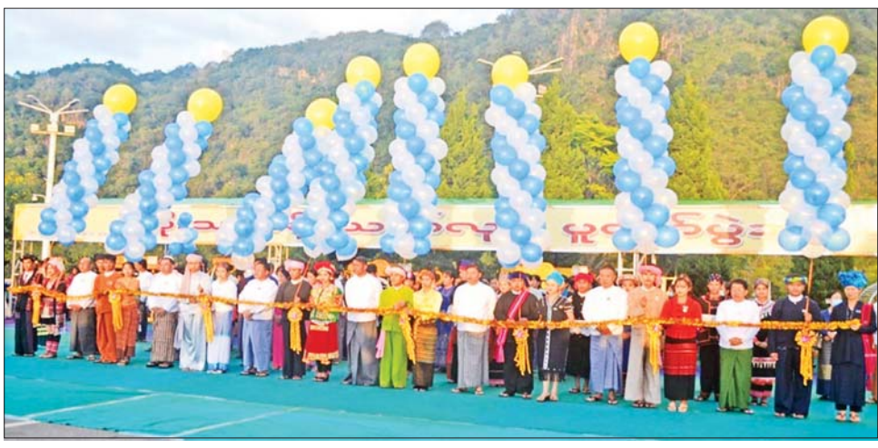
တောင်ကြီးမြို့ရှိ စုဠာမုနိလောကချမ်းသာ စေတီတော်ရင်ပြင်၌ မသိုးသင်္ကန်းတော်များ ရက်လုပ်ဆက်ကပ်လှူဒါန်းပွဲတွင် ရှမ်းပြည်နယ်ဝန်ကြီးချုပ် ဒေါက်တာကျော်ထွန်းနှင့် တာဝန်ရှိသူများက ဖဲကြီးဖြတ်ဖွင့်လှစ်ပေးစဉ်။

ကြသည်။ ထို့နောက် ဆရာတော်၊ သံဃာတော်များ၊ တိုင်းဒေသကြီးနှင့် ပြည်နယ်များမှ ဝန်ကြီးချုပ်များ၊ တိုင်းစစ်ဌာနချုပ်များမှ တိုင်းမှူးများနှင့် တက်ရောက်လာကြသူများက ရက်လုပ်ထားသော မသိုးသင်္ကန်းတော်များနှင့် ဘုရား၊ စေတီ၊ ပုထိုးများအား လှူညှိလည်ပူဇော်ကြပြီး ဗုဒ္ဓရုပ်ပွားတော်များကို မသိုးသင်္ကန်းတော်များ ဆက်ကပ်လှူဒါန်းခြင်းနှင့် ဗုဒ္ဓါအဘိသေက အနေကဇာတင်ခြင်းများ ဆောင်ရွက်ကြသည်။ ယင်းနောက် ဆရာတော်များထံမှ ငါးပါးသီလ ခံယူဆောင်တည်ကြပြီး သံဃာတော်များ ရွတ်ပွားချီးမြှင့်တော်မူသော ပရိတ်တရားတော်များ နာယူကြည့်ကြသည်။ ထို့နောက် တိုင်းဒေသကြီးနှင့် ပြည်နယ်များမှ ဝန်ကြီးချုပ်များ၊ တိုင်းမှူးများနှင့် တက်ရောက်လာကြသူများက သံဃာတော်များအား လှူဖွယ်ဝတ္ထုပစ္စည်းများနှင့် နဝကမ္မအလှူငွေများ ဆက်ကပ်လှူဒါန်းကြပြီး ဆရာတော်များထံမှ အနုမောဒနာတရား နာကြားကာ လှူဒါန်းမှုအစုစုတို့အတွက် ရေစက်