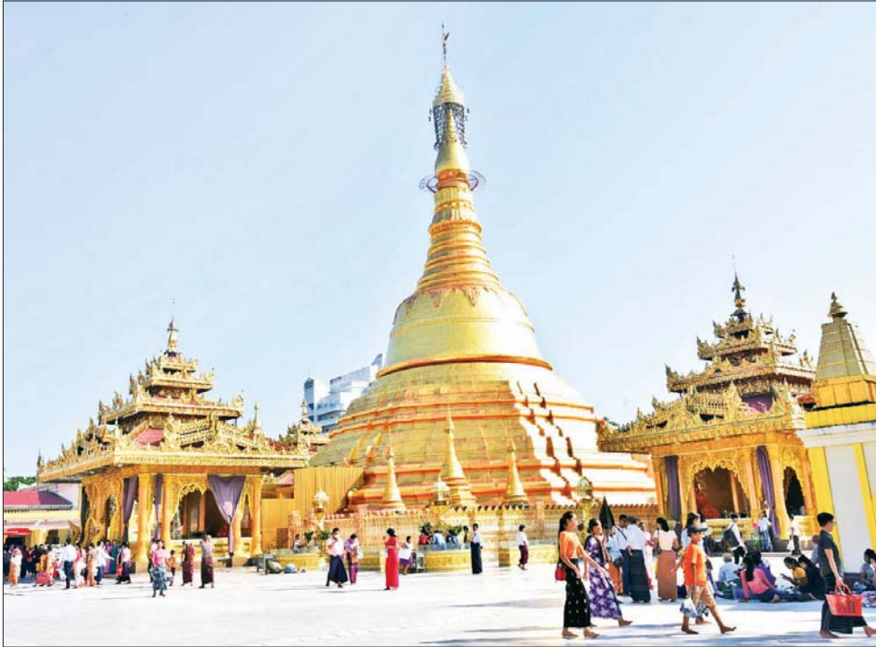
နိုဝင်ဘာ ၇ ရက် (တန်ဆောင်မုန်းလပြည့်နေ့)တွင် ဗိုလ်တထောင် ကျိုက်ဒေးအပ်ဆံတော်ဦး စေတီတော်၌ ဘုရားဖူးလာပြည်သူများဖြင့် စည်ကားစွာ တွေ့ရစဉ်။ ဇော်မင်းလတ်

မြန်မာသက္ကရာဇ် ၁၃၈၄ ခုနှစ် တန်ဆောင်မုန်း လပြည့် (သာမညဖလ အခါတော်နေ့)၌ မြန်မာနိုင်ငံတစ်ဝန်း အမြို့မြို့ အနယ်နယ်ရှိ တန်ခိုးကြီး ဘုရားစေတီပုထိုးများ၌ မသိုး သင်္ကန်း ရက်လုပ်လှူဒါန်း ပူဇော်ကြသူများနှင့် နိဗ္ဗာန်ကို ရည်မှန်း၍ ကောင်းမှုအစုစုတို့ ပြုလုပ်ကြသူများ၊ ဘုရားဖူး ပြည်သူများဖြင့် စည်ကား များပြားလှသည့် မြင်ကွင်း အဖုံဖုံကို စုစည်းဖော်ပြအပ် ပါသည်။