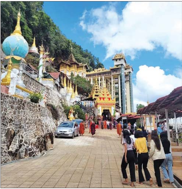
ပင်းတယမြို့ ရွှေမင်္ဂလာစေတီတော်သို့ တန်ဆောင်မုန်းလပြည့်နေ့ အခါသမယ၌ ဘုရားဖူးစဉ်သည်များ၊ အပန်းဖြေလာရောက် လည်ပတ်သူများဖြင့် စည်ကားနေသည်ကိုတွေ့ရစဉ်။ အောင်ကိုဦး (ပြန်/ဆက်)