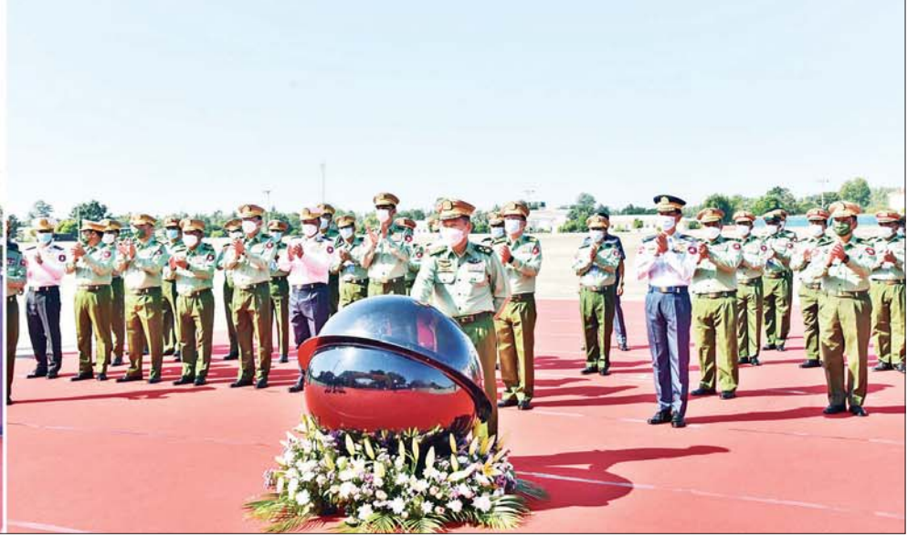
နိုင်ငံတော်စီမံအုပ်ချုပ်ရေးကောင်စီ ဒုတိယဥက္ကဋ္ဌ ဒုတိယတပ်မတော်ကာကွယ်ရေးဦးစီးချုပ် ကာကွယ်ရေးဦးစီးချုပ် (ကြည်း) ဒုတိယဗိုလ်ချုပ်မှူးကြီး စိုးဝင်း (၇၅) နှစ်မြောက် စိန်ရတု ထောက်ပံ့နှင့်ပို့ဆောင်ရေး တပ်ဖွဲ့နေ့ဆိုင်ရာတော်စဉ် စက်ခလုတ်နှိပ် ဖွင့်လှစ်ပေးစဉ်။