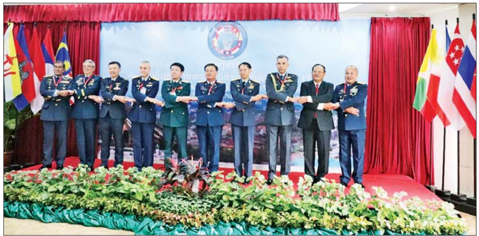
အာဆီယံ လေတပ်ဦးစီးချုပ်များ စုပေါင်းမှတ်တမ်းတင်ဓာတ်ပုံရိုက်စဉ်။

ယင်းနောက် ကာကွယ်ရေး ဦးစီးချုပ်(လေ) ဦးဆောင်သော ကိုယ်စားလှယ် အဖွဲ့သည် နိုဝင်ဘာ ၄ ရက် နံနက်ပိုင်းတွင် လွန်ပရာဘန်မြို့တော်ရှိ Luang Prabang View ဟိုတယ်၌ ကျင်းပပြုလုပ်သော (၁၉) ကြိမ် မြောက် အာဆီယံလေတပ်ဦးစီး ချုပ်များ အစည်းအဝေး (19 th