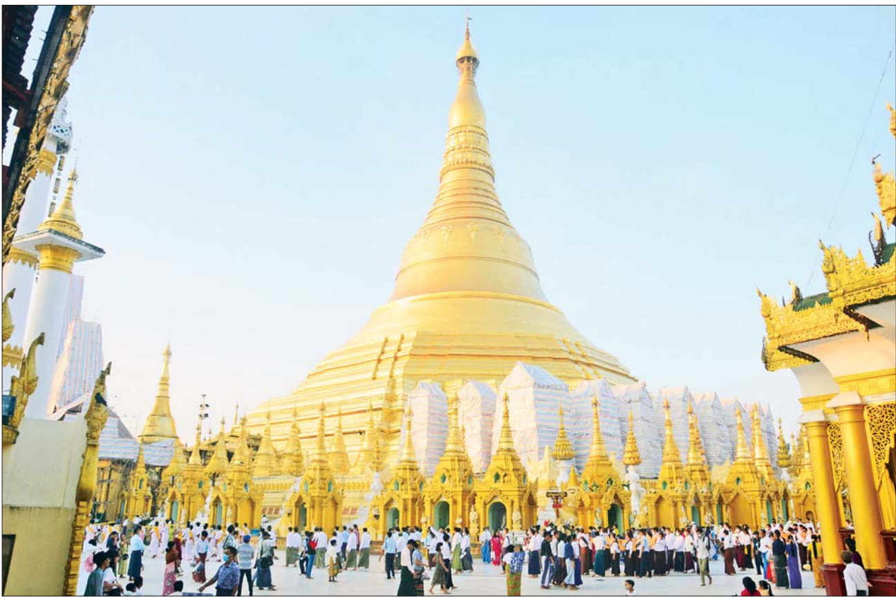
တန်ဆောင်မုန်းလပြည့်နေ့(သာမညဖလအခါတော်နေ့)တွင် ရွှေတိဂုံစေတီတော်၌ ဘုရားဖူးကုသိုလ်ပြုသူများဖြင့် စည်ကားနေစဉ်။

ရန်ကုန် နိုဝင်ဘာ ၇ ယနေ့သည် တန်ဆောင်မုန်းလပြည့်နေ့ (သာမညဖလအခါတော်နေ့)ဖြစ်သည်။ သာမညဖလသုတ္တန် ဒေသနာတော် (ရဟန်းပြုခြင်းအကျိုး)ကို ဗုဒ္ဓဘုရားရှင်က တန်ဆောင်မုန်းလပြည့် ညမြတ်တွင် ရာဇဂြိုဟ်ပြည့်ရှင် အဇောတသတ်မင်းအား အကြောင်းပြု၍ ဟောတော်မူခဲ့ခြင်းကို သာသနာ့မှတ်တိုင် စိုက်ထူသောအားဖြင့် တန်ဆောင်မုန်းလပြည့်နေ့ကို သာမညဖလအခါတော်နေ့ အဖြစ် သတ်မှတ်ကျင်းပခဲ့ခြင်းဖြစ်သည်။ တန်ဆောင်မုန်းလပြည့်နေ့ကို ရှေးအခါက ကြယ်တာရာနက္ခတ်ပေါင်းစုံ ကွန်မြူးသဖြင့် နက္ခတ်သဘင်အခါကာလဟု သတ်မှတ်ကာ နက္ခတ်တာရာများအား ဆီမီးရောင်စုံဖြင့် ထွန်းညှိပသပူဇော်သော မီးထွန်းပွဲတော်ကို ကျင်းပခဲ့ခြင်းလည်း ဖြစ်သည်။ သို့ရာတွင် ထေရဝါဒ ဗုဒ္ဓသာသနာထွန်းကားသော မိမိတို့ မြန်မာနိုင်ငံသည် ဆီမီးထွန်းခြင်းကို ဘုရားရှင်အား ပူဇော်ခြင်းအဖြစ် ပြောင်းလဲကျင်းပခဲ့ကြသည်။