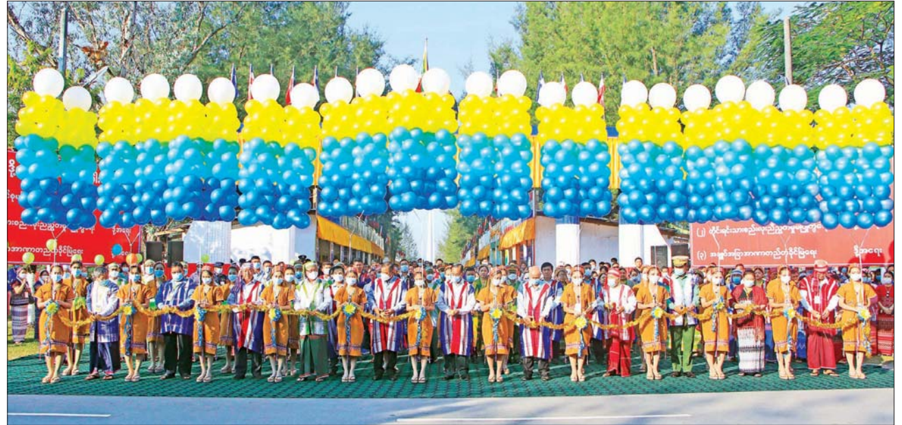
(၆၇) နှစ်မြောက် ကရင်ပြည်နယ်နေ့ အထိမ်းအမှတ် မုခ်ဦးနှင့် ပြခန်းများကို နိုင်ငံတော်စီမံအုပ်ချုပ်ရေးကောင်စီဝင် မန်းငြိမ်းမောင်၊ စောဒန်နီရယ်၊ ပြည်ထောင်စုဝန်ကြီး ဒုတိယဗိုလ်ချုပ်ကြီး ထွန်းထွန်းနောင်၊ ဦးစောထွန်းအောင်မြင့်၊ ကရင်ပြည်နယ် ဝန်ကြီးချုပ် ဦးစောမြင့်ဦးနှင့် တာဝန်ရှိ သူများက ဖဲကြိုးဖြတ်ဖွင့်လှစ်ပေးစဉ်။

ယင်းနောက် နယ်စပ်ရေးရာ ဝန်ကြီးဌာန ပြည်ထောင်စုဝန်ကြီး ဒုတိယဗိုလ်ချုပ်ကြီး ထွန်းထွန်း နောင် က ၉၀ W ဆိုလာ အစုံ ၁၀၀၊ အားကစားနှင့် လူငယ်ရေးရာ ဝန်ကြီးဌာန ပြည်ထောင်စုဝန်ကြီး ဦးမင်းသိန်း၊ Outdoor Fitness ၁၀ စုံ၊ ဘောလုံး၊ ဘော်လီဘော၊ ပိုက်ကျော်ခြင်း အားကစားပစ္စည်း များကို ကရင်ပြည်နယ်ဝန်ကြီးချုပ် ထံ ပေးအပ်ကြသည်။