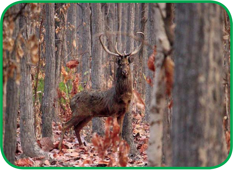
ချပ်သင်းဘေးမွဲတောတွင် ကျက်စားနေသည့် သမင်တစ်ကောင်။