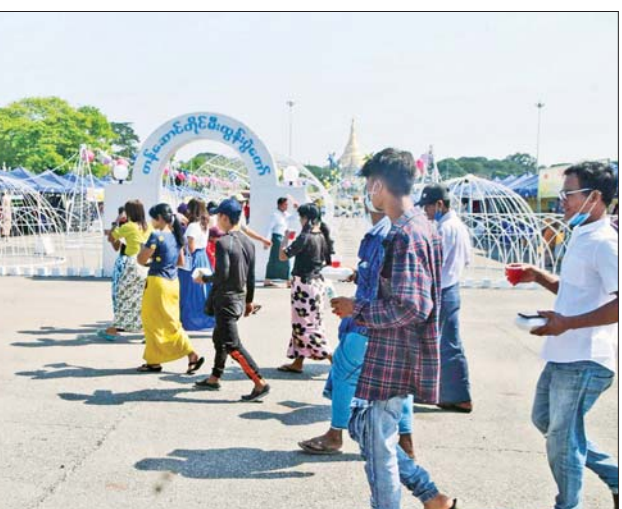
ပြည်သူရင်ပြင်နှင့် ပြည်သူ့ဥယျာဉ်၌ လာရောက်လည်ပတ်သူများဖြင့် စည်ကားနေစဉ်။

အလားတူ မဟာဝိဇယစေတီတော်၊ ဆူးလေစေတီတော်၊ ဝရဒါဌာဓာတုစေတီယ စွယ်တော်မြတ်စေတီတော် (ရန်ကုန်)၊ မင်းဓမ္မကုန်းရှိ လောကချမ်းသာအဘယလဘာမုနိ ဗုဒ္ဓရုပ်ပွားတော်မြတ်ကြီး၊ ရှေးဟောင်းသမိုင်းဝင် အပရာဇိတဆံတော်ရှင် ကျိုက်ပိုင်းစေတီတော်၊ ငါးထပ်ကြီးဘုရား၊ ခြောက်ထပ်ကြီးဘုရား၊ ရွှေဘုန်းပွင့်စေတီတော်၊ ကိုးထပ်ကြီးဘုရား၊ သမိုင်းဝင်ကျိုက္ကစံဆံတော်ရှင်စေတီတော် နှင့် ဆုတောင်းပြည့် မယ်လမုစေတီတော်တို့တွင်လည်း ဂေါပက