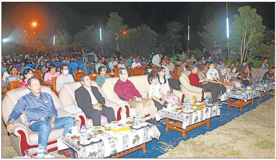
ပြည်ထောင်စုဝန်ကြီး ဦးမောင်မောင်အုန်းနှင့်ဇနီး ဒေါ်ခင်ဆွေဝင်းနှင့် အဖွဲ့ မြန်မာ့အသံနှင့်ရုပ်မြင်သံကြားမှ ဝန်ထမ်းများ၏ တေးသီချင်းများ သီဆိုနေမှုကို ကြည့်ရှုအားပေးစဉ်။

ပျော်ရွှင်စွာဆင်နွှဲ အဆိုပါ ပွဲတော်သို့ ပြည်ထောင်စုဝန်ကြီး ဦးမောင်မောင်အုန်းနှင့်ဇနီး ဒေါ်ခင်ဆွေဝင်း၊ ဌာနဆိုင်ရာ အကြီးအကဲများ၊ ဖိတ်ကြားထားသည့် ဧည့်သည်တော်များ၊ အနုပညာရှင်များ၊ ဝန်ထမ်းများနှင့် ၎င်းတို့၏ မိသားစုဝင်များ တက်ရောက်၍ ပျော်ရွှင်စွာဆင်နွှဲကြသည်။ ပွဲတော် မစတင်မီ ပြည်ထောင်စုဝန်ကြီးနှင့် အဖွဲ့သည် မြန်မာ့အသံနှင့် ရုပ်မြင်သံကြားရှိ မဟာဗေဒမိ ပြုပြင်မှုခွဲ ခွင်ဘုရား ဆီမီးတစ်ထောင် ပူဇော်ပွဲသို့ တက်ရောက်ပြီး ပန်း၊ ရေချမ်းနှင့် ဆီမီးတို့ကို ကပ်လှူ