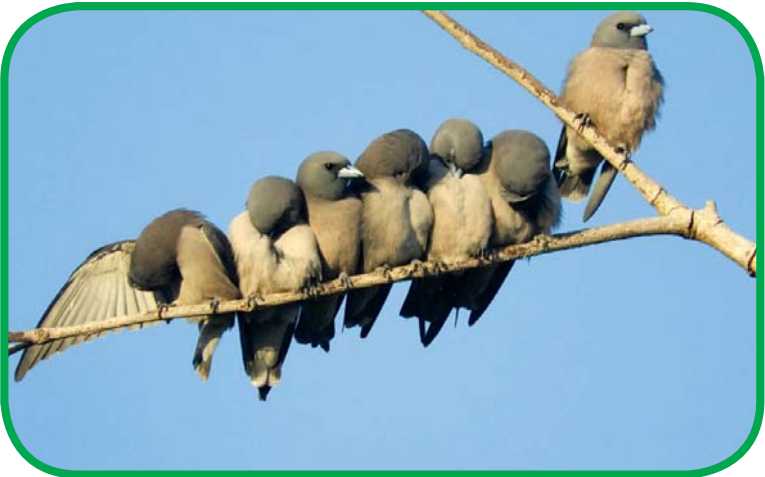
ချပ်သင်းဘေးမွဲတောအတွင်းမှ ငှက်မျိုးစိတ်အချို့ကို တွေ့ရစဉ်။

သို့ဖြစ်ပေရာ ဒေသခံပြည်သူများ၊ သဘာဝပတ်ဝန်းကျင်နှင့် ဂေဟစနစ်ကို ချစ်မြတ်နိုးသူများအနေဖြင့် မြန်မာ့ရွှေသမင်တို့ ပျော်စရာ ချပ်သင်းတောရိုင်းတိရစ္ဆာန်ဘေးမွဲတော အရှည် တည်တံ့ရေး၊ ကောင်ရေလျော့ကျလာသော မြန်မာ့ရွှေသမင် ကောင်ရေနှင့် အင်တိုင်းတော ဂေဟစနစ်အနေအထားကို အချိန်မီကုစားမြှင့်တင်နိုင်ရေးအတွက် တာဝန်ရှိသူအဆိုင်ရာ ဝန်ထမ်းများနှင့်အတူ အသိစိတ်ဓာတ် အပြည့်အဝဖြင့် ပူးပေါင်း ပါဝင်ကြလုပ်ဆောင်သင့်ပါကြောင်း နှိုးဆော်မှုပြုလိုက်ရ ပါသည်။ ။