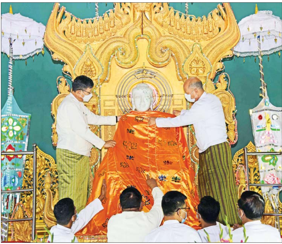
ဥပုသ်သင်္ကြံစေတီတော်မြတ်ကြီးရှိ ဗုဒ္ဓရုပ်ပွားတော်အား နေပြည်တော်ကောင်စီဥက္ကဋ္ဌ ဦးတင်ဦးလွင်နှင့် ဒုတိယဝန်ကြီး ဦးအေးထွန်းတို့ ရွှေကြာသင်္ကန်း ကပ်လှူပူဇော်စဉ်။

ယင်းနောက် ဘဒ္ဒန္တပဏ္ဍိတ အမှူးပြုသော ဆရာတော်၊ သံဃာ တော်များအား ဒုတိယဝန်ကြီးနှင့် ဇနီး၊ နေပြည်တော်တိုင်းစစ်ဌာန ချုပ် ဒုတိယတိုင်းမှူးနှင့် တာဝန်ရှိ သူများက လှူဖွယ်ဝတ္ထုပစ္စည်း များ ဆက်ကပ်လှူဒါန်းကြပြီး အနုမောဒနာတရား နာယူကြကာ လှူဒါန်းမှုအစုအဝေးတွင် ရေစက် သွန်းလောင်း အမျှပေးဝေကြ သည်။ ဥပုသ်သင်္ကြံ စေတီတော်မြတ် ကြီး၏ ပရိဝုဏ်အတွင်း ရတနာ ဆင်ဖြူတော် ထိန်းသိမ်းစောင့် ရှောက်ရေးဥယျာဉ်ရှိ ရတနာ ဆင်ဖြူတော် အဆောင်တွင် ဆင်စာကျွေးကြသူများ၊ နိဗ္ဗာန်