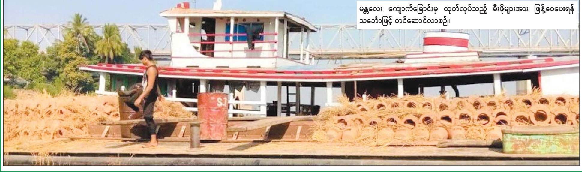
မန္တလေး ကျောက်မြောင်းမှ ထုတ်လုပ်သည့် မီးဖိုများအား ဖြန့်ဝေပေးရန် သင်္ဘောဖြင့် တင်ဆောင်လာစဉ်။

UNFCCC မှ ထုတ်လုပ်ခွင့်ပြုခဲ့၍ အိန္ဒိယနိုင်ငံနှင့် စတင်ပူးပေါင်း လုပ်ဆောင်ခဲ့ပြီးနောက် ကိုရီးယား နိုင်ငံနှင့် ဆက်လက်ပူးပေါင်း လုပ်ဆောင်ခဲ့သည်။ ၂၀၁၈ ခုနှစ်တွင် မြန်မာနိုင်ငံ ရာသီဥတု ပြောင်းလဲမှုဆိုင်ရာ မူဝါဒအဖွဲ့ကို ဖွဲ့စည်းပြီးနောက် မီးဖိုကို တရားဝင်ထုတ်လုပ်ခွင့်ရရှိရန် နိုင်ငံတော်သို့ တင်ပြ၍ ကျေးလက်ဖွံ့ဖြိုးရေးနှင့် ကာဗွန် ထုတ်လုပ်မှု လျှော့ချရေးအတွက် အီးဖရီးမီးဖိုကို ထုတ်လုပ်ခဲ့ရာ အီးလုပ်ငန်းလုပ်ကိုင်သော ကျေးလက်နေပြည်သူများ ဝင်ငွေမှန်ကို ရရှိခဲ့ပြီး ၂၀၁၉ ခုနှစ်မှ ၂၀၂၁ ခုနှစ်အထိ အီးဖရီးမီးဖို နှစ်သန်း ခန့် ထုတ်လုပ်နိုင်ခဲ့ကြောင်း ထင်းများစွာ အသုံးပြုရာ မှ အနည်းငယ်အသုံးပြုခြင်းဖြင့် မီးဖိုထုတ်လုပ်မှုကို လျှော့ချနိုင်ခဲ့သည့်အပြင် သစ်တောပြုန်းတီးမှုကို ထိန်းသိမ်းနိုင်ခဲ့သည်။ ကျေးလက်ဒေသတို့တွင် ကာဗွန်ထုတ်လုပ်မှုကို လျှော့ချနိုင်ခဲ့သည့်အတွက် မြန်မာနိုင်ငံစဉ်အသင်းအနေဖြင့် တစ်နှစ်လျှင် အီးဖရီးမီးဖို နှစ်သန်းထုတ်လုပ်၍ ကျေးရွာ အိမ်ထောင်စု ခုနှစ်သန်းထံ အခမဲ့ဖြန့်ဝေနိုင်ရန် ရည်မှန်းဆောင်ရွက်လျက်ရှိကာ ကာဗွန်ထုတ်လုပ်မှု ၄၅ ရာခိုင်နှုန်း လျှော့ချပေးနိုင်သည့် အီးဖရီး မီးဖိုထုတ်လုပ်မှုကို နိုင်ငံသုံးနိုင် ဆက်လက်ပူးပေါင်း လုပ်ဆောင်သွားမည်ဖြစ်ကြောင်း သိရသည်။ ။