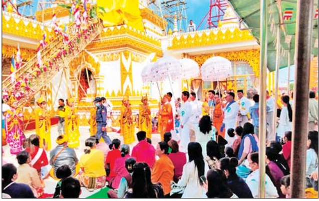
မြတ်ကို နာယူပန်ဆင်ကြသည်။ ထို့နောက် အလှူရှင်များက ဆရာတော်များထံ စိန်ဖူးတော်၊ ငှက်မြတ်နားတော်၊ ရွှေထီးတော် များနှင့် လှူဖွယ်ဝတ္ထုပစ္စည်း များကို ဆက်ကပ်လှူဒါန်းကြပြီး