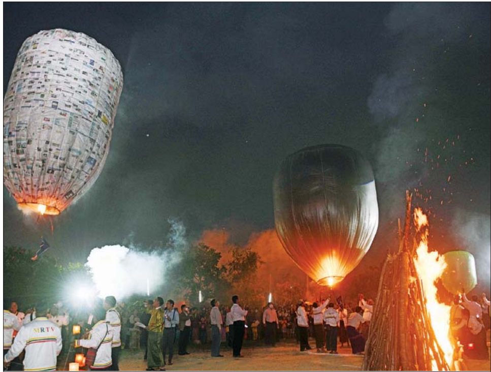
မြန်မာ့အသံနှင့်ရုပ်မြင်သံကြား ဝန်ထမ်းမိသားစုများ၏ တန်ဆောင်တိုင်ပွဲတော် စည်ကားစွာ ကျင်းပနေမှုကို တွေ့ရစဉ်။