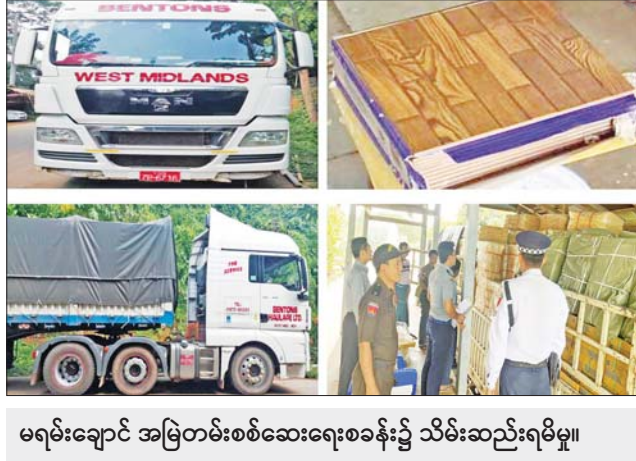
မရမ်းချောင်း အမြဲတမ်းစစ်ဆေးရေးစခန်း၌ သိမ်းဆည်းရမိမှု။