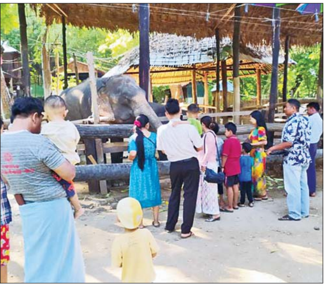
မန္တလေးတိုင်းဒေသကြီး ညောင်ဦးမြို့နယ် အနောက်ပုလင်းကျေးရွာအနီး ဖွင့်လှစ်ထားရှိသည့် ပလင်းကမ်းသာယာဆင်စခန်းသို့ တန်ဆောင်မုန်းလပြည့်နေ့တွင် အပန်းဖြေလာရောက်သူများနှင့် ဆင်များအား လေ့လာလိုသူ ခရီးသွားပြည်သူများဖြင့် စည်ကားနေမှုကို တွေ့ရစဉ်။ ကိုကြေးမုံ