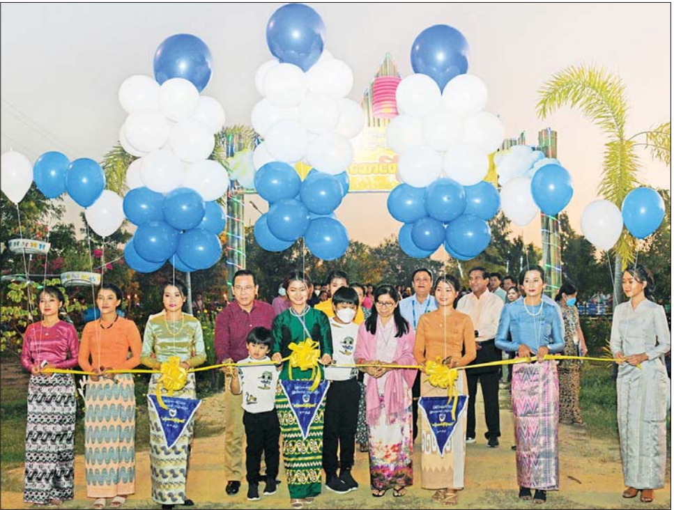
ပြည်ထောင်စုဝန်ကြီး ဦးမောင်မောင်အုန်းနှင့်ဇနီး ဒေါ်ခင်ဆွေဝင်း မြန်မာ့အသံနှင့် ရုပ်မြင်သံကြား ဝန်ထမ်းမိသားစုများ၏ တန်ဆောင်တိုင်ပွဲတော်ကို ဖဲကြိုးဖြတ်ဖွင့်လှစ်ပေးစဉ်။