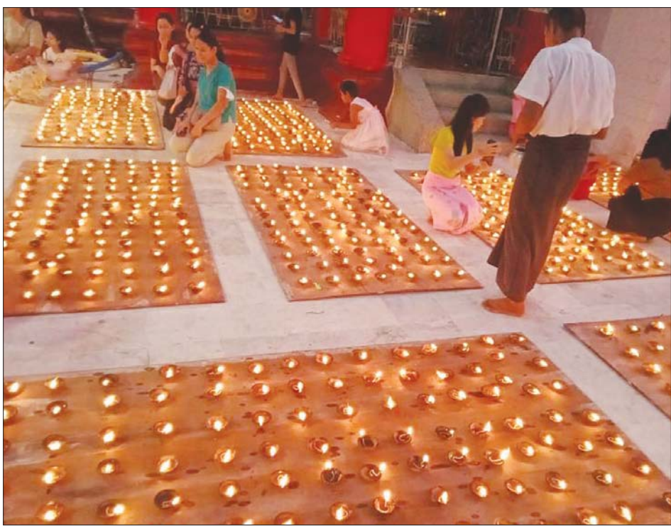
သန်လျင်မြို့ရှိ ရှေးဟောင်းသမိုင်းဝင် ဆံတော်ရှင် ကျိုက်ခေါက်စေတီတော်မြတ်ကြီး အာရုံခံတန်ဆောင်း ၌ ဆီမီးကပ်လှူပူဇော်ထားမှုကို တွေ့ရစဉ်။ သန်းဝင်း(သန်လျင်)