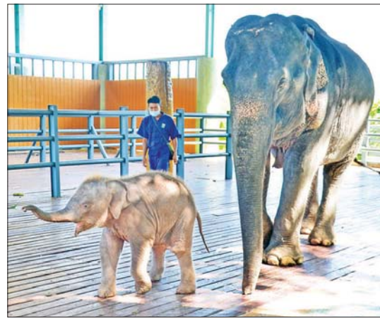
အဓိပ္ပာယ် အပြည့်အစုံမှာ- တိုင်းပြည်က ချစ်ခင်မြတ်နိုး၍ နိုင်ငံတော်၏ သာယာဝပြော

လပြည့်ယနေ့တွင် နိုင်ငံတစ်ဝန်းရှိ ဘုရား စေတီပုထိုးများတွင် ကုသိုလ်ပြုကြသူများ၊ အလှူဒါန ပြုကြသူများဖြင့် စည်ကား သိုက်မြိုက်လျက်ရှိသည့် အပြင် နေပြည်တော် ဥပါတ္တသန္တီ စေတီတော်မြတ်ကြီးရှိ ဆင်ဖြူ တော်ဆောင်တွင် အောက်တိုဘာ ၃၀ ရက်က ဘွဲ့နာမံတော် အမည် ပေး ကင်ပွန်းတပ်နှင့် အဆောင် တော်တက် မင်္ဂလာပြုလုပ်ထား