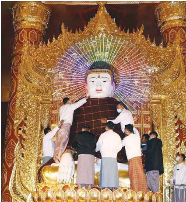
ပြင်ဦးလွင်မြို့ရှိ မဟာအံ့ထူးကံသာ ဆုတောင်းပြည့်ဘုရားကြီး အား တန်ဆောင်မုန်းလပြည့်နေ့၌ မသိုးသင်္ကန်းရက်လုပ် ကပ်လှူပူဇော်စဉ်။ ခရိုင်(ပြန်/ဆက်)