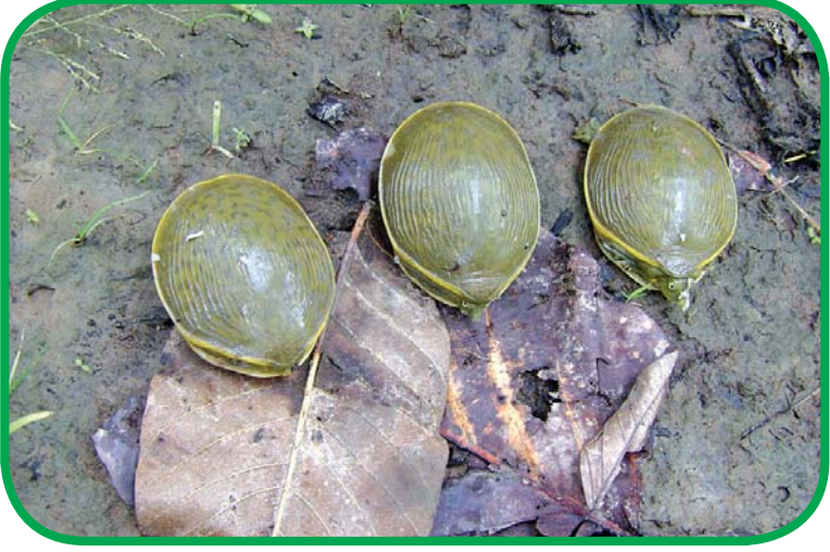
ချပ်သင်းဘေးမွဲတောတွင် ထိန်းသိမ်းထားသည့် လိပ်မျိုးစိတ်များကို တွေ့ရစဉ်။

ချပ်သင်းတောရိုင်းတိရစ္ဆာန်ဘေးမွဲတော တည်တံ့ရေး အတွက် သစ်တောဦးစီးဌာန သဘာဝဝန်းကျင်နှင့် သားငှက် တိရစ္ဆာန်ထိန်းသိမ်းရေးဌာနသည် နော်ဝေနိုင်ငံ ပတ်ဝန်းကျင် ရေးရာအေဂျင်စီ (NEA) နှင့် ပူးပေါင်းကာ ၂၀၁၉-၂၀၂၀ ခုနှစ်မှ ၂၀၂၃-၂၀၂၄ ခုနှစ်အထိ ငါးနှစ်တာအုပ်ချုပ်လုပ်ကိုင်မှုစီမံချက် ကို ဆောင်ရွက်လျက်ရှိသည့်အပြင် ၁၀ နှစ်တာ တောရိုင်း တိရစ္ဆာန်များအတွက်နေရင်းဒေသများ ပြန်လည်တည်ထောင် ခြင်းလုပ်ငန်းစီမံချက် (၂၀၁၉-၂၀၂၀ မှ ၂၀၂၈-၂၀၂၉) များကို လည်း အကောင်အထည်ဖော်လျက်ရှိကြောင်း ကြားသိရသည်။ အဆိုပါစီမံချက်များအရ ဘေးမွဲတောအတွင်းရှိ ဇီဝမျိုးစုံ မျိုးကွဲများ ဖြစ်တည်မှုနှင့် ဒေသခံကျေးလက်နေပြည်သူတို့၏