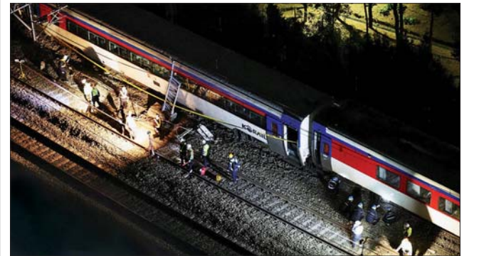
ဆိုးလ်မြို့၌ လမ်းချော်မှုဖြစ်ပွားသည့် ရထားကို တွေ့ရစဉ်။

မနီလာ နိုဝင်ဘာ ၇ ဖိလစ်ပိုင်နိုင်ငံတွင် နိုဝင်ဘာ ၇ ရက်က ကိုဗစ်-၁၉ ထပ်မံကူးစက် ဖြစ်ပွားသူ ၁၅၅၃ ဦးရှိကြောင်း အတည်ပြုဖော်ပြမှုနှင့်အတူ နိုင်ငံအတွင်း ကိုဗစ်-၁၉ ကူးစက်ဖြစ်ပွားသူပေါင်း ၄၀၁၀၂၆ ဦး ရှိလာပြီဖြစ်သည်။ ကျန်းမာရေးဝန်ကြီးဌာနက လတ်တလောကိုဗစ်-၁၉ ကူးစက် ဖြစ်ပွားသူ ၁၆၇၅၄ ဦးရှိကြောင်းနှင့် ၁၇ ဦးထပ်မံသေဆုံးကြောင်း ဖော်ပြခဲ့သည်။ အသစ်ထပ်မံသေဆုံးသူ ၁၇ ဦးနှင့်အတူ စုစုပေါင်း သေဆုံးသူ ၆၄၂၉၁ ဦး အထိရှိလာပြီဖြစ်သည်။ မြို့တော်မနီလာတွင် ကိုဗစ်-၁၉ ကြောင့်သေဆုံးသူ ၃၄၂ ဦးရှိသည်။ ဖိလစ်ပိုင်နိုင်ငံတွင် ဇန်နဝါရီ ၁၅ ရက်က တစ်ရက်တည်း ကိုဗစ်-၁၉ ကူးစက်ဖြစ်ပွားသူ ၃၉၀၀၄ ဦးဖြင့်အမြင့်ဆုံး စံချိန်တင်ခဲ့သည်။ လူဦးရေ သန်း ၁၁၀ နီးပါးရှိသော ဖိလစ်ပိုင်နိုင်ငံတွင် ကိုဗစ်-၁၉ ကာကွယ်ဆေး ထိုးပြီးသူပေါင်း ၇၃ ဒသမ ၅ သန်းရှိသည်။ ဆင်ယွာ