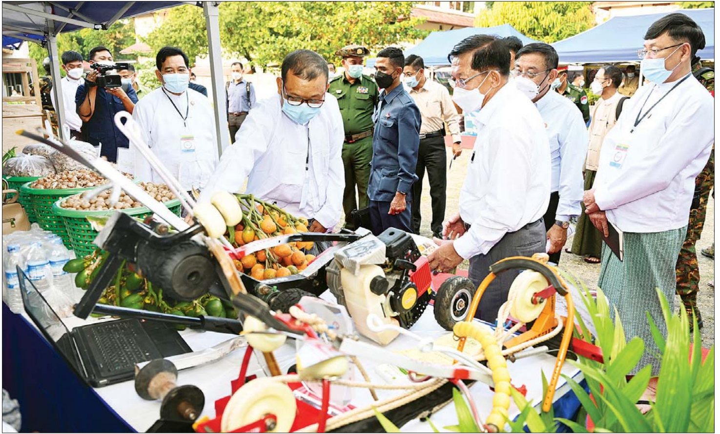
နိုင်ငံတော်စီမံအုပ်ချုပ်ရေးကောင်စီဥက္ကဋ္ဌ နိုင်ငံတော်ဝန်ကြီးချုပ် ဗိုလ်ချုပ်မှူးကြီး မင်းအောင်လှိုင် ဒေသထုတ်ကုန်ပစ္စည်းများ ခင်းကျင်းပြသထားမှုကို ကြည့်ရှုလေ့လာစဉ်။

ဦးလှမိုး၊ ဦးခင်မောင်ရီ၊ ဒေါက်တာချာလီသန်းနှင့် ဦးအောင်နိုင်ဦးတို့က ဝန်ကြီးဌာနအလိုက် လုပ်ငန်း အကောင်အထည်ဖော် ဆောင်ရွက်လျက်ရှိမှု အခြေအနေများ၊ စီးပွားရေးလုပ်ငန်းများအတွက် နိုင်ငံတော်မှ ချေးငွေများကို ကာလအပိုင်းအခြား အလိုက် အတိုးနှုန်းသက်သာစွာဖြင့် ဆောင်ရွက် ပေးလျက်ရှိပြီး တင်ပြချက်များတွင် ပါဝင်သည့် ချေးငွေရယူလိုမှုအပေါ် သတ်မှတ်ချက်နှင့်အညီ ခွင့်ပြုပေးနိုင်ရေး ပေါင်းစပ်ညှိနှိုင်း ဆောင်ရွက်ပေး သွားမည်ဖြစ်သည် အခြေအနေများ၊ ချေးငွေများ ပြန်လည်ရရှိမှုသာလျှင် နိုင်ငံတော်၏ လည်ပတ်သုံးစွဲ ငွေများ ပြန်လည်ရရှိမည်ဖြစ်ပြီး စီးပွားရေးကဏ္ဍ သည်လည်း ဖွံ့ဖြိုးတိုးတက်လာမည်ဖြစ်သဖြင့် လုပ်ငန်းရှင်များအနေဖြင့် မိမိတို့ရယူထားသည့် ချေးငွေများကို သတ်မှတ်ကာလအတွင်း အချိန်မီ ပြန်လည်ပေးဆပ်ရန် လိုအပ်မှု၊ ကျေးလက်နေ ပြည်သူများ ဝင်ငွေတိုးပွားရေးနှင့် ကျေးလက်ဒေသ များ ဖွံ့ဖြိုးတိုးတက်ရေးအတွက် သမဝါယမအစုအဖွဲ့ များ ဖွဲ့စည်း၍ လိုအပ်သည်များ ကူညီပံ့ပိုးပေးလျက် ရှိမှု၊ စိုက်ပျိုးရေးလုပ်ငန်းများ အောင်မြင်စွာ ဆောင်ရွက်နိုင်ရေးအတွက် သမဝါယမအသင်းအဖွဲ့ များ ဖွဲ့စည်း၍ Contract Farming စနစ်ဖြင့် ချိတ်ဆက်ဆောင်ရွက်ပေးကာ စိုက်ပျိုးရေးတောင်သူ များ၏ လိုအပ်ချက်များအား ဖြည့်ဆည်းပေးနိုင်ရေး ဆောင်ရွက်လျက်ရှိမှု၊ ငါးလုပ်ငန်းအတွက် အဖိုးတန် သည့် ဒီရေတောများကို ထိန်းသိမ်းဆောင်ရွက်သွား ကြရန်လိုအပ်မှု၊ ကြိမ်လုပ်ငန်းမှလည်း ဒေသတွင်း