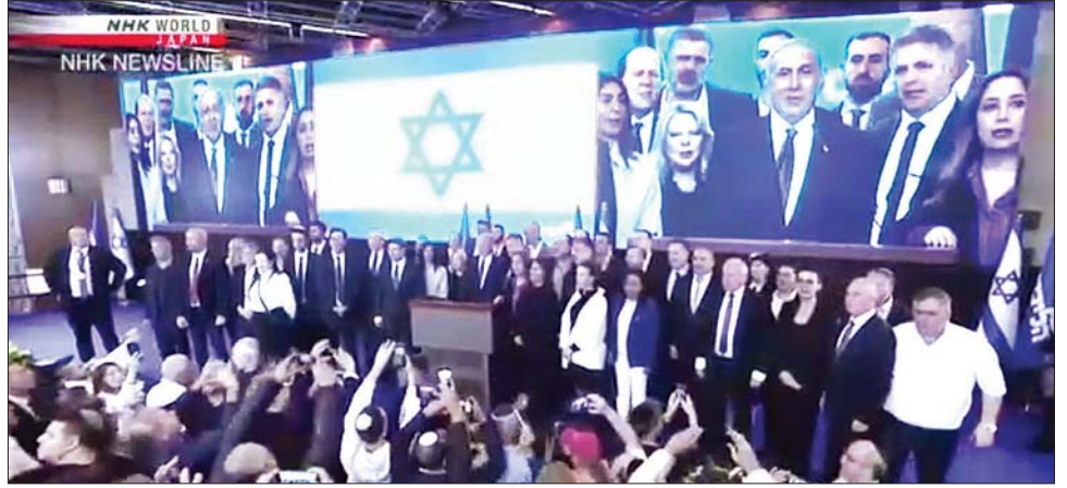
အစ္စရေးဝန်ကြီးချုပ်ဟောင်း ဘင်ဂျမင်နေတန်ယာဟု အခမ်းအနားတစ်ခုတွင် မိန့်ခွန်းပြောနေစဉ်။