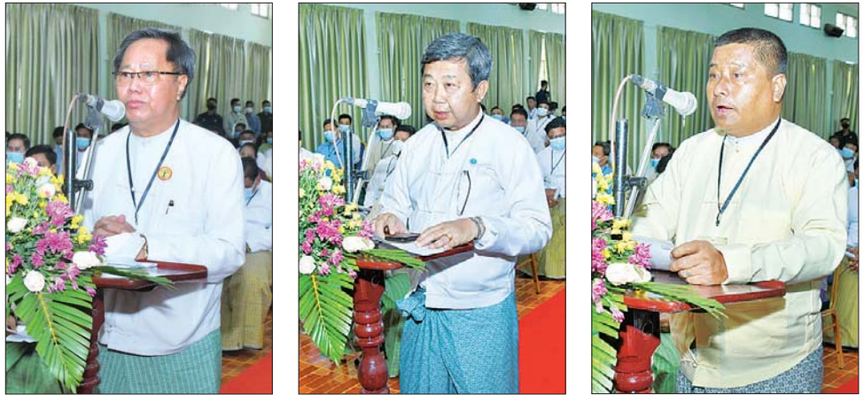
စီးပွားရေးလုပ်ငန်းရှင်များ ရှင်းလင်းတင်ပြစဉ်။

ထားဝယ်ဒေသ ဖွံ့ဖြိုးတိုးတက်ရေးအတွက် ဒေသတွင်းနေထိုင်သူများက ကြိုးပမ်းဆောင်ရွက် ရမည်ဖြစ်ကြောင်း၊ ဒေသတွင်းမှထွက်ရှိသည့် ကုန်ကြမ်းများကို အသုံးပြု၍ ကုန်ထုတ်လုပ်မှုလုပ်ငန်း များကို အောင်မြင်အောင် ဆောင်ရွက်ကြရမည် ဖြစ်ကြောင်း၊ လိုအပ်သည့် ပံ့ပိုးမှုများကိုလည်း နိုင်ငံတော်မှ ဆောင်ရွက်ပေးသွားမည်ဖြစ်ကြောင်း၊ ကုန်ထုတ်လုပ်မှုများ တိုးတက်စေရန်အတွက် အားလုံးဝိုင်းဝန်း ကြိုးပမ်းဆောင်ရွက်ကြစေ လိုကြောင်းဖြင့် တိုက်တွန်းဆွေးနွေးပြောကြားသည်။ ယင်းနောက် နိုင်ငံတော်စီမံအုပ်ချုပ်ရေးကောင်စီ ဥက္ကဋ္ဌ နိုင်ငံတော်ဝန်ကြီးချုပ်သည် တက်ရောက် လာကြသည့် ထားဝယ်ခရိုင်အတွင်းရှိ အသေးစား၊ အငယ်စားနှင့် အလတ်စား စီးပွားရေး (MSME) လုပ်ငန်းရှင်များအား ရင်းရင်းနှီးနှီး နှုတ်ဆက်သည်။ ထို့နောက် နိုင်ငံတော်စီမံအုပ်ချုပ်ရေးကောင်စီ ဥက္ကဋ္ဌ နိုင်ငံတော်ဝန်ကြီးချုပ်သည် ခင်းကျင်းပြသ ထားသည့် စားသောက်ကုန်၊ လူသုံးကုန်၊ စက်မှု လက်မှုထုတ်ကုန်၊ ရိုးရာလက်မှုထုတ်ကုန်များ၊ အဝတ်အထည်များ၊ တိုင်းရင်းဆေးများ စသည့် ထုတ်ကုန်ပစ္စည်းများ ခင်းကျင်းပြသထားရှိမှုများကို ပြုကွက်တစ်ခုချင်းစီအလိုက် စိတ်ဝင်တစားဖြင့် လေ့လာခဲ့ပြီး ဈေးကွက်ရရှိမှု အခြေအနေများကို မေးမြန်းဆွေးနွေးရာ လုပ်ငန်းအလိုက် စီးပွားရေး လုပ်ငန်းရှင်များက လိုက်လံရှင်းလင်းတင်ပြကြသည်။ ယင်းနောက် နိုင်ငံတော်စီမံအုပ်ချုပ်ရေး ကောင်စီဥက္ကဋ္ဌ နိုင်ငံတော်ဝန်ကြီးချုပ် နှင့် အဖွဲ့ဝင် များသည် ထားဝယ်မြို့ ကမ်းနားလမ်းတစ်လျှောက် မော်တော်ယာဉ်များဖြင့် လှည့်လည်ကြည့်ရှုခဲ့ကြောင်း သတင်းရရှိသည်။ သတင်းစဉ်