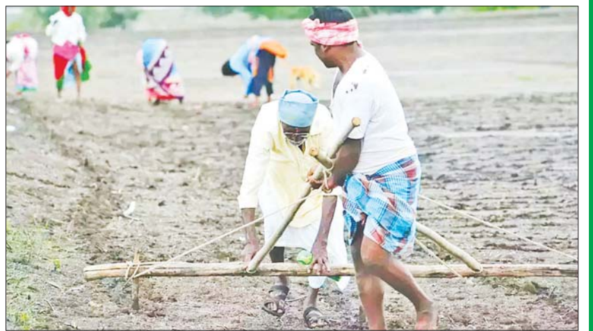
ပဲမျိုးစုံစိုက်ပျိုးရန် မြေယာပြုပြင်နေသည့် အိန္ဒိယတောင်သူများ။

အိန္ဒိယနိုင်ငံ ဒေလီနှင့် မွန်ဘိုင်းဈေးကွက်များတွင် ပဲခွဲစက်ရုံများ၏ ဝယ်လိုအားနှင့် ရာသီဥတုဆိုးရွားလာမှုကြောင့် မတ်ပဲဈေး ၁ ဒသမ ၃ ရာခိုင်နှုန်းမြင့်တက်လာကြောင်း၊ တစ်ချိန်တည်းမှာပင် အိန္ဒိယအစိုးရအေဂျင်စီ Nafed က အရန်ပဲသိုလှောင်ရန် ရည်ရွယ်ပြီး ပြည်ပမှတင်သွင်းထားသော မတ်ပဲများ အနက်မှ မတ်ပဲတန်ချိန် ၁၅၀၀ ကို ဝယ်ယူခဲ့ကြောင်း၊ အိန္ဒိယနိုင်ငံကို မတ်ပဲတင်ပို့လျက် ရှိသော မြန်မာ့မတ်ပဲ FAO ဈေးနှုန်း တစ်တန်