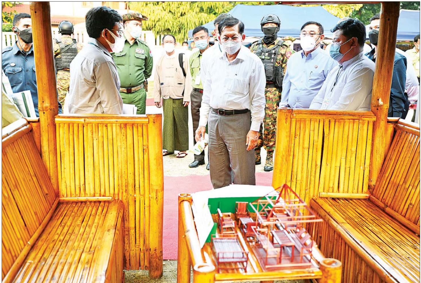
နိုင်ငံတော်စီမံအုပ်ချုပ်ရေးကောင်စီဥက္ကဋ္ဌ နိုင်ငံတော်ဝန်ကြီးချုပ် ဗိုလ်ချုပ်မှူးကြီး မင်းအောင်လှိုင် ဒေသထုတ်ကုန်ပစ္စည်းများ ခင်းကျင်းပြသထားမှုကို ကြည့်ရှုလေ့လာစဉ်။