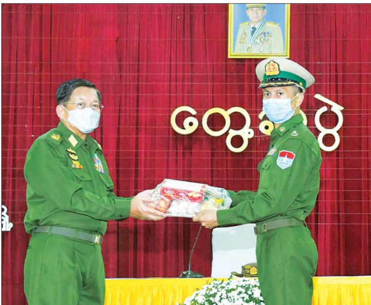
နိုင်ငံတော်စီမံအုပ်ချုပ်ရေးကောင်စီဥက္ကဋ္ဌ တပ်မတော်ကာကွယ်ရေးဦးစီးချုပ် ဗိုလ်ချုပ်မှူးကြီး မင်းအောင်လှိုင် အရာရှိ၊ စစ်သည်၊ မိသားစုများအတွက် စားသောက်ဖွယ်ရာပစ္စည်းများ ပေးအပ်စဉ်။

နေပြည်တော် နိုဝင်ဘာ ၄ နိုင်ငံတော်စီမံအုပ်ချုပ်ရေးကောင်စီ ဥက္ကဋ္ဌ တပ်မတော် ကာကွယ်ရေးဦးစီးချုပ် ဗိုလ်ချုပ်မှူးကြီး မင်းအောင်လှိုင်သည် ဇနီးဒေါ်ကြူကြူလှ၊ ကာကွယ်ရေးဦးစီးချုပ်(ရေ) ဗိုလ်ချုပ်ကြီး မိုးအောင်နှင့်ဇနီး၊ ကာကွယ်ရေးဦးစီးချုပ်ရုံးမှ တပ်မတော် အရာရှိကြီးများနှင့် ဇနီးများ၊ ကမ်းရိုးတန်းဒေသတိုင်းစစ်ဌာနချုပ် တိုင်းမှူး ဗိုလ်ချုပ်စောသန်းလှိုင်နှင့် တာဝန်ရှိသူများ လိုက်ပါ၍ ယနေ့နံနက်ပိုင်းတွင် ကမ်းရိုးတန်းဒေသတိုင်းစစ်ဌာနချုပ် ထားဝယ်တပ်နယ်မှ အရာရှိ၊ စစ်သည် မိသားစုများအား တွေ့ဆုံအမှာစကား ပြောကြားသည်။ နိုင်ငံရေးဖြစ်ပေါ်ပြောင်းလဲမှု ထိုသို့ တွေ့ဆုံအမှာစကားပြောကြားရာတွင် နိုင်ငံတော်တွင် ဖြစ်ပေါ်လာသည့် အခြေအနေများအရ နိုင်ငံတော်ကို နိုင်ငံရေးအရ အရေးပေါ်အခြေအနေကြေညာခဲ့ပြီး တပ်မတော်မှ နိုင်ငံ့တာဝန်များကို ထမ်းဆောင်ခဲ့ရသည့် အခြေအနေများ၊ ခေတ်အဆက်ဆက် အုပ်ချုပ်ပုံစနစ်များ ပြောင်းလဲခဲ့မှုနှင့် ပါတီစုံဒီမိုကရေစီလမ်းကြောင်းပေါ်တွင် လျှောက်လမ်းနိုင်ရေး တပ်မတော်မှ ဆောင်ရွက်ပေးခဲ့သည့် အခြေအနေများ၊ နိုင်ငံတော်၏ နိုင်ငံရေးဖြစ်ပေါ်ပြောင်းလဲမှု အခြေအနေများနှင့် စပ်လျဉ်း၍ ဦးစွာ ရှင်းလင်းပြောကြားသည်။ ကာကွယ်ရေးစွမ်းပကားမြင့်မားစေရေး ကြိုးပမ်းတည်ဆောက် ထို့နောက် နိုင်ငံတော်စီမံအုပ်ချုပ်ရေးကောင်စီဥက္ကဋ္ဌ တပ်မတော်ကာကွယ်ရေးဦးစီးချုပ်က ဆက်လက်ပြောကြားရာတွင်