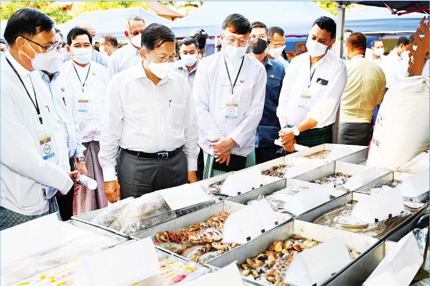
နိုင်ငံတော်စီမံအုပ်ချုပ်ရေးကောင်စီဥက္ကဋ္ဌ နိုင်ငံတော်ဝန်ကြီးချုပ် ဗိုလ်ချုပ်မှူးကြီး မင်းအောင်လှိုင် ဒေသထုတ်ကုန်ပစ္စည်းများ ခင်းကျင်းပြသထားမှုကို ကြည့်ရှုလေ့လာစဉ်။

ပြည်ထောင်စုဝန်ကြီးများက သက်ဆိုင်ရာ ကဏ္ဍအလိုက် ပြန်လည်ရှင်းလင်းဆွေးနွေး ဆက်လက်ပြီး လုပ်ငန်းရှင်များ၏ တစ်ဦးချင်း ရှင်းလင်းတင်ပြမှုများနှင့် ပတ်သက်၍ ပြည်ထောင်စုဝန်ကြီးများဖြစ်ကြသည့် ဦးဝင်းရှိန်၊ ဒေါက်တာကံဇော်၊ စာမျက်နှာ ၄ သို့