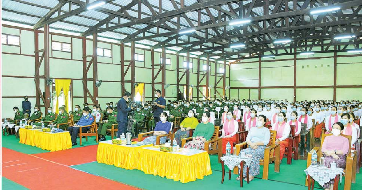
နိုင်ငံတော်စီမံအုပ်ချုပ်ရေးကောင်စီဥက္ကဋ္ဌ တပ်မတော်ကာကွယ်ရေးဦးစီးချုပ် ဗိုလ်ချုပ်မှူးကြီး မင်းအောင်လှိုင် ကမ်းရိုးတန်းဒေသတိုင်းစစ်ဌာနချုပ် ထားဝယ်တပ်နယ်မှ အရာရှိ၊ စစ်သည် မိသားစုများအား တွေ့ဆုံအမှာစကားပြောကြားစဉ်။