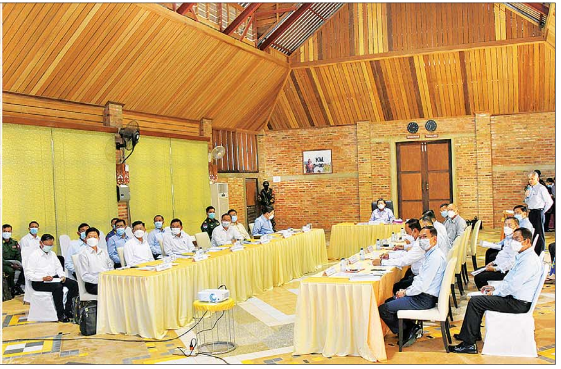
နိုင်ငံတော်စီမံအုပ်ချုပ်ရေးကောင်စီဥက္ကဋ္ဌ နိုင်ငံတော်ဝန်ကြီးချုပ် ဗိုလ်ချုပ်မှူးကြီး မင်းအောင်လှိုင် အား ပြည်ထောင်စုဝန်ကြီး ဦးအောင်နိုင်ဦးက ထားဝယ်အထူးစီးပွားရေးဇုန် ဆောင်ရွက်မှုအခြေအနေများ ရှင်းလင်းတင်ပြစဉ်။

* ရှေ့ဖွံ့ဖြိုးမှု ဦးစွာ နိုင်ငံတော်စီမံအုပ်ချုပ်ရေးကောင်စီဥက္ကဋ္ဌ နိုင်ငံတော်ဝန်ကြီးချုပ်အား စီမံကိန်းရှင်းလင်းဆောင်၌ စီးပွားရေးနှင့် ကူးသန်းရောင်းဝယ်ရေး ဝန်ကြီးဌာန ပြည်ထောင်စုဝန်ကြီး ဦးအောင်နိုင်ဦးနှင့် ထားဝယ်အထူးစီးပွားရေးဇုန် စီမံခန့်ခွဲမှုကော်မတီ ဥက္ကဋ္ဌဦးအောင်စိုးတို့က ထားဝယ်အထူးစီးပွားရေးဇုန် စီမံကိန်းစတင်အကောင်အထည်ဖော်ဆောင်ရွက်ခဲ့မှု အကြောင်းအမျိုးမျိုးကြောင့် လုပ်ငန်းဆောင်ရွက်မှု များတိုးတက်ရန် နှောင့်နှေးကြန့်ကြာခဲ့ရမှု စီးပွားရေးဇုန် နယ်နိမိတ်အတွင်း တည်ဆောက်ပြီး၊ တည်ဆောက်ဆဲနှင့် တည်ဆောက်ရန်ကျန် ဆိပ်ခံ တံတားများ၊ စက်ရုံများ၊ အဆောက်အအုံများ ဆောင်ရွက်ထားရှိမှု၊ စီမံကိန်းလုပ်ငန်းများ ဆက်လက်အကောင်အထည်ဖော်ရန် လိုအပ်ချက် များနှင့် ဆက်လက်ဆောင်ရွက်သွားမည့် အခြေအနေ များကို ရှင်းလင်းတင်ပြကြသည်။