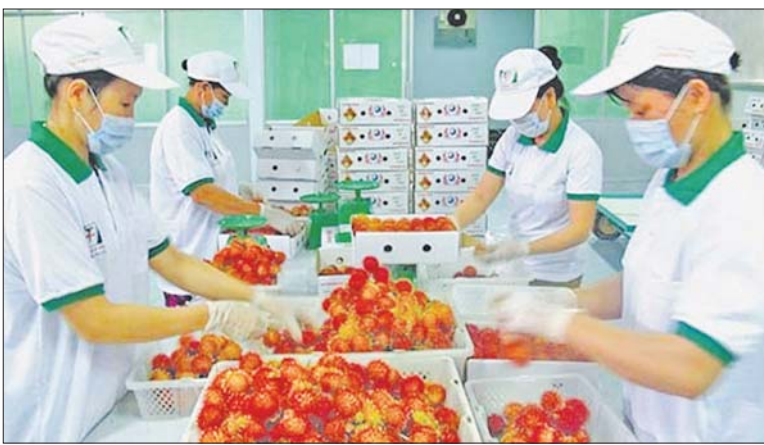
ဗီယက်နမ်မှ ဥရောပဈေးကွက်သို့ တင်ပို့မည့် သစ်သီးများကို ထုပ်ပိုးနေစဉ်။

ဟန့်ရှင်း နိုဝင်ဘာ ၄ ထိုင်းနိုင်ငံ၏ သစ်သီးထုတ်လုပ်မှုသည် ၂၀၂၂ ခုနှစ်တွင် သစ်သီးထုတ်လုပ်မှု ဝင်ငွေ အမေရိကန်ဒေါ်လာ ၈ ဒသမ ၅၃ ဘီလီယံခန့်ရှိမည်ဟု ခန့်မှန်းထားရာ ဗီယက်နမ်နိုင်ငံ သစ်သီးထုတ်လုပ်ငန်းကဏ္ဍအနေဖြင့် ထိုင်းနိုင်ငံကို အမိလိုက်နိုင်ရန် ရည်ရွယ်ထားကြောင်း သိရသည်။