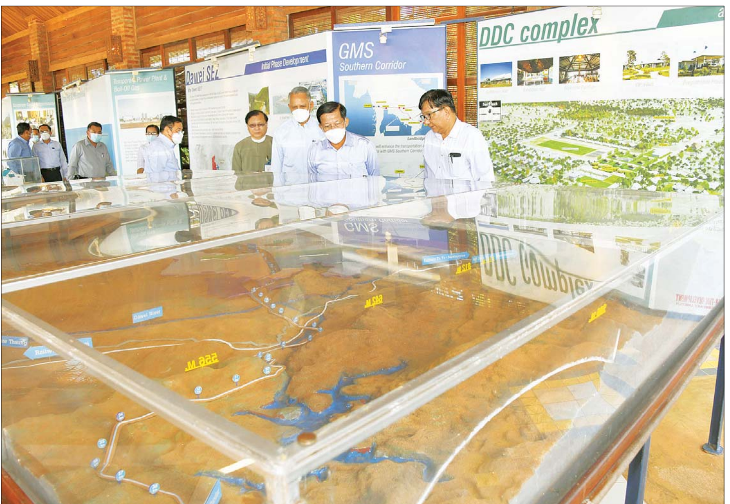
နိုင်ငံတော်စီမံအုပ်ချုပ်ရေးကောင်စီဥက္ကဋ္ဌ နိုင်ငံတော်ဝန်ကြီးချုပ် ဗိုလ်ချုပ်မှူးကြီး မင်းအောင်လှိုင် စီမံကိန်းအကွက်ချပုံစံငယ်အား ကြည့်ရှုစဉ်။

* ရှေ့ဖွံ့ဖြိုးမှု ဦးစွာ နိုင်ငံတော်စီမံအုပ်ချုပ်ရေးကောင်စီဥက္ကဋ္ဌ နိုင်ငံတော်ဝန်ကြီးချုပ်အား စီမံကိန်းရှင်းလင်းဆောင်၌ စီးပွားရေးနှင့် ကူးသန်းရောင်းဝယ်ရေး ဝန်ကြီးဌာန ပြည်ထောင်စုဝန်ကြီး ဦးအောင်နိုင်ဦးနှင့် ထားဝယ်အထူးစီးပွားရေးဇုန် စီမံခန့်ခွဲမှုကော်မတီ ဥက္ကဋ္ဌဦးအောင်စိုးတို့က ထားဝယ်အထူးစီးပွားရေးဇုန် စီမံကိန်းစတင်အကောင်အထည်ဖော်ဆောင်ရွက်ခဲ့မှု အကြောင်းအမျိုးမျိုးကြောင့် လုပ်ငန်းဆောင်ရွက်မှု များတိုးတက်ရန် နှောင့်နှေးကြန့်ကြာခဲ့ရမှု စီးပွားရေးဇုန် နယ်နိမိတ်အတွင်း တည်ဆောက်ပြီး၊ တည်ဆောက်ဆဲနှင့် တည်ဆောက်ရန်ကျန် ဆိပ်ခံ တံတားများ၊ စက်ရုံများ၊ အဆောက်အအုံများ ဆောင်ရွက်ထားရှိမှု၊ စီမံကိန်းလုပ်ငန်းများ ဆက်လက်အကောင်အထည်ဖော်ရန် လိုအပ်ချက် များနှင့် ဆက်လက်ဆောင်ရွက်သွားမည့် အခြေအနေ များကို ရှင်းလင်းတင်ပြကြသည်။