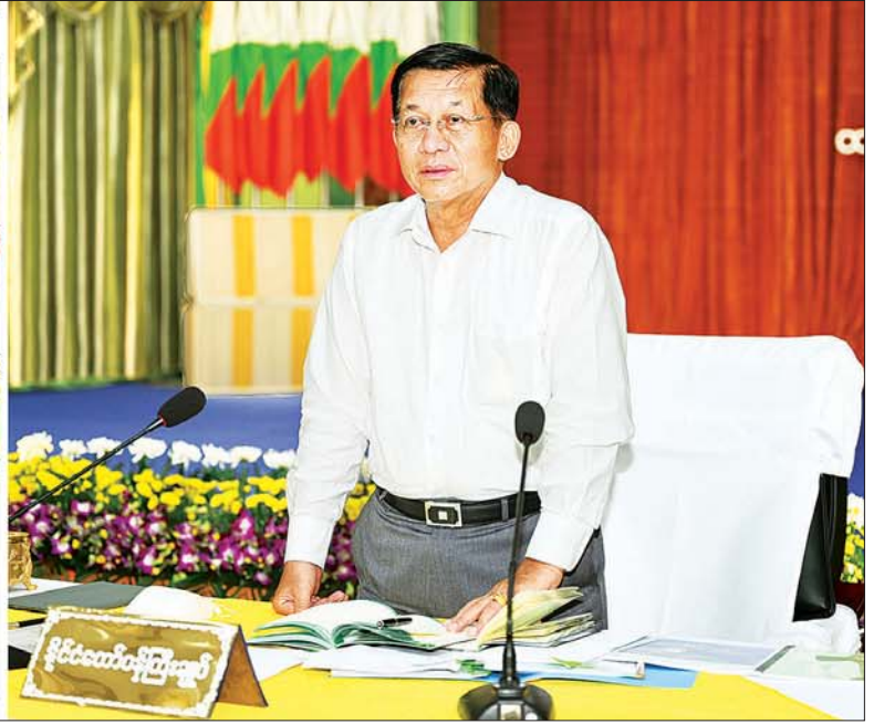
နိုင်ငံတော်စီမံအုပ်ချုပ်ရေးကောင်စီဥက္ကဋ္ဌ နိုင်ငံတော်ဝန်ကြီးချုပ် ဗိုလ်ချုပ်မှူးကြီး မင်းအောင်လှိုင် တနင်္သာရီတိုင်းဒေသကြီး ထားဝယ်ခရိုင်အတွင်းရှိ အသေးစား၊ အငယ်စားနှင့် အလတ်စား စီးပွားရေး (MSME) လုပ်ငန်းရှင်များအား တွေ့ဆုံအမှာစကားပြောကြားစဉ်။

နေပြည်တော် နိုဝင်ဘာ ၄ နိုင်ငံတော်စီမံအုပ်ချုပ်ရေးကောင်စီဥက္ကဋ္ဌ နိုင်ငံတော်ဝန်ကြီးချုပ် ဗိုလ်ချုပ်မှူးကြီး မင်းအောင်လှိုင် သည် ထားဝယ်ခရိုင်အတွင်းရှိ အသေးစား၊ အငယ်စားနှင့် အလတ်စား စီးပွားရေး (MSME) လုပ်ငန်းရှင်များအား ထားဝယ်မြို့၊ မြို့နယ်ခန့်မ၌ တွေ့ဆုံ၍ စီးပွားရေး လုပ်ငန်းများ ဖွံ့ဖြိုးတိုးတက်ရေးအတွက် ဆွေးနွေးပြောကြားသည်။ အဆိုပါတွေ့ဆုံပွဲသို့ နိုင်ငံတော်စီမံအုပ်ချုပ်ရေးကောင်စီဥက္ကဋ္ဌ နိုင်ငံတော်ဝန်ကြီးချုပ်နှင့်အတူ ကောင်စီတွဲဖက်အတွင်းရေးမှူး၊ ဒုတိယဗိုလ်ချုပ်ကြီး ရဲဝင်းဦး၊ ကောင်စီဝင် Jeng Phang နော်တောင်၊ ပြည်ထောင်စုဝန်ကြီးများဖြစ်ကြသည့် ဦးဝင်းရှိန်၊