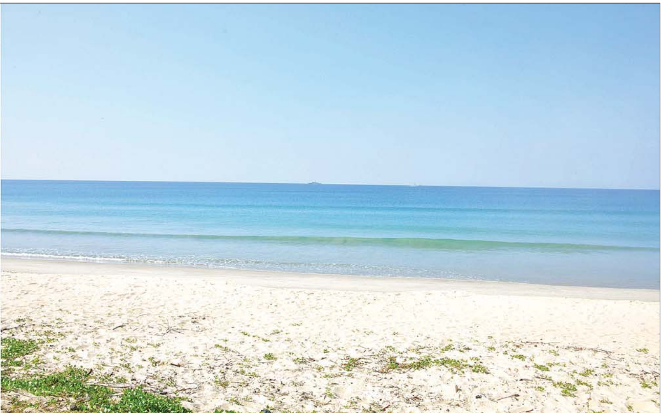
နိုင်ငံတော်စီမံအုပ်ချုပ်ရေးကောင်စီဥက္ကဋ္ဌ နိုင်ငံတော်ဝန်ကြီးချုပ် ဗိုလ်ချုပ်မှူးကြီး မင်းအောင်လှိုင် ထားဝယ်အထူးစီးပွားရေးဇုန်နှင့် ရေနက်ဆိပ်ကမ်းစီမံကိန်း လျာထားသည့်နေရာများ ကြည့်ရှုစစ်ဆေးစဉ်။

နေပြည်တော် နိုဝင်ဘာ ၄ နိုင်ငံတော်စီမံအုပ်ချုပ်ရေးကောင်စီဥက္ကဋ္ဌ နိုင်ငံတော် ဝန်ကြီးချုပ် ဗိုလ်ချုပ်မှူးကြီး မင်းအောင်လှိုင် သည် ကောင်စီတွဲဖက်အတွင်းရေးမှူး ဒုတိယ