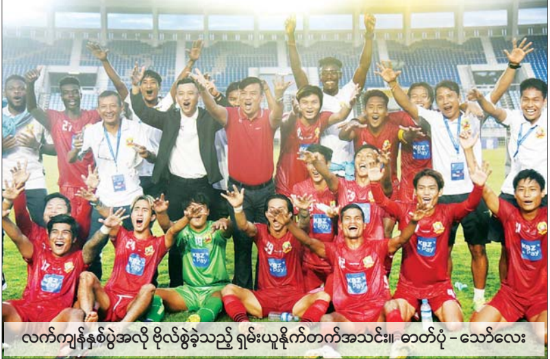
လက်ကျန်နှစ်ပွဲအလို ဗိုလ်စွဲခဲ့သည့် ရှမ်းယူနိုက်တက်အသင်း။

ရန်ကုန် နိုဝင်ဘာ ၄ လက်ရှိကျင်းပနေသည့် ၂၀၂၂ ရာသီ MNL ပြိုင်ပွဲတွင် ပြိုင်ပွဲမပြီးဆုံးမီ ဗိုလ်စွဲခဲ့သည့် ရှမ်းယူနိုက်တက်အသင်းသည် ရှမ်းပွဲမရှိ စံချိန်ထပ်မံရယူနိုင်ရန် လက်ကျန်နှစ်ပွဲတွင် ကြိုးပမ်းသွားမည်ဖြစ်သည်။ ရှမ်းယူနိုက်တက်အသင်းသည် နိုဝင်ဘာ ၃ ရက်က ယှဉ်ပြိုင်ကစားခဲ့သည့် ပွဲစဉ် (၁၈) တွင် ဟံသာဝတီအသင်းကို နှစ်ဂိုးပြတ်အနိုင်ရခဲ့သဖြင့် လက်ကျန်နှစ်ပွဲအလိုတွင် ချန်ပီယံဆုရယူနိုင်ခဲ့ခြင်းဖြစ်သည်။ ရှမ်းယူနိုက်တက်အသင်းသည် MNL အမှတ်ပေးချန်ပီယံဆုကို လေးကြိမ်မြောက် ရယူနိုင်ခြင်းဖြစ်ပြီး သုံးရာသီဆက်တိုက် ရရှိခဲ့ခြင်းလည်းဖြစ်သည်။ စာမျက်နှာ ၁၀ ကော်လံ ၁ ၀