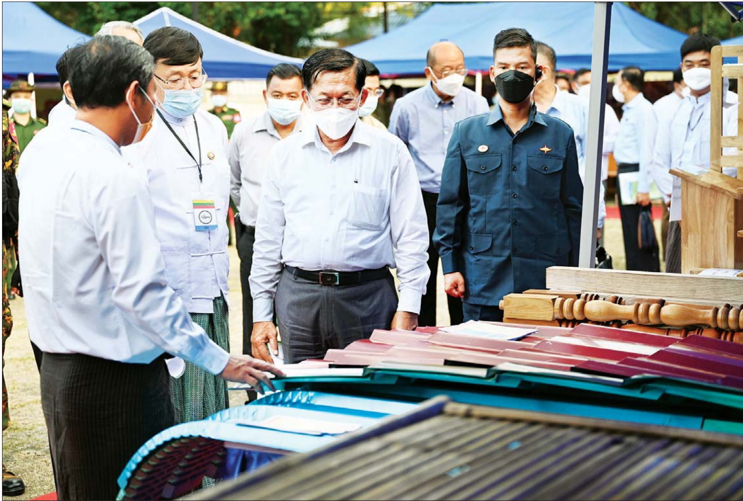
နိုင်ငံတော်စီမံအုပ်ချုပ်ရေးကောင်စီဥက္ကဋ္ဌ နိုင်ငံတော်ဝန်ကြီးချုပ် ဗိုလ်ချုပ်မှူးကြီး မင်းအောင်လှိုင် ဒေသထုတ်ကုန်ပစ္စည်းများ ခင်းကျင်းပြသထားမှုကို ကြည့်ရှုလေ့လာစဉ်။

ကုန်ကြမ်းပစ္စည်း၊ အရင်းအနှီး၊ နည်းပညာနှင့် လူသားအရင်းအမြစ်ကောင်းများ ရရှိရန်လိုအပ် အကြောင်းအမျိုးမျိုးကြောင့် ရပ်တန့်ထားရသည့် ထားဝယ်အထူးစီးပွားရေးဇုန်စီမံကိန်း ဆက်လက်