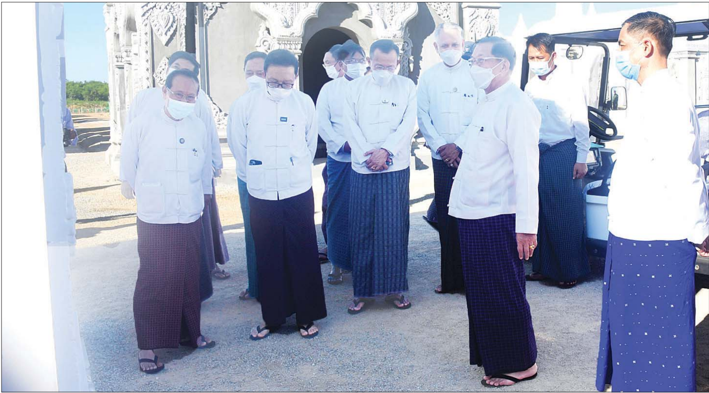
နိုင်ငံတော်စီမံအုပ်ချုပ်ရေးကောင်စီဥက္ကဋ္ဌ နိုင်ငံတော်ဝန်ကြီးချုပ် ဗိုလ်ချုပ်မှူးကြီး မင်းအောင်လှိုင်နှင့် အဖွဲ့ဝင်များ ကျောက်စာရုံများ တည်ဆောက်ပြီးစီးမှုအခြေအနေကို ကြည့်ရှုစဉ်။

ထိုကဲ့သို့ ရုပ်ပွားတော်မြတ်ကြီး ထုဆစ်နေသည့်နည်းတူ ဗုဒ္ဓဥယျာဉ်တော်ကြီးအတွင်း သာသနာရေးဆိုင်ရာ အခမ်းအနားကြီးများ ကျင်းပပြုလုပ်နိုင်မည့် သံဃာအပါး ၁၂၀၀ နှင့် လူပရိသတ်များ