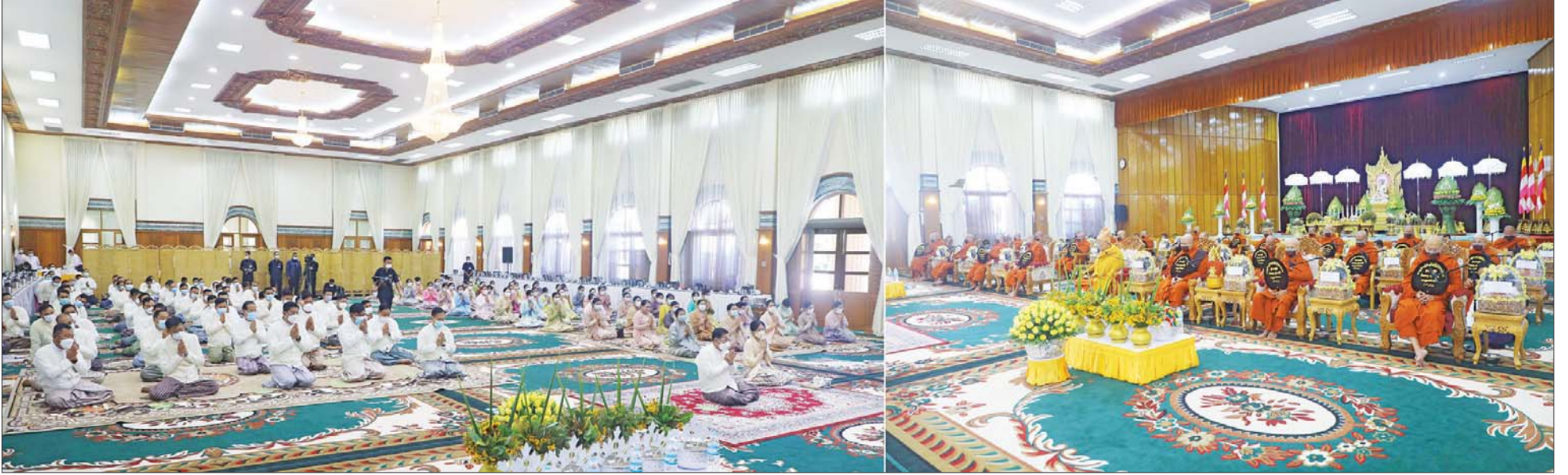
နိုင်ငံတော်စီမံအုပ်ချုပ်ရေးကောင်စီဥက္ကဋ္ဌ တပ်မတော်ကာကွယ်ရေးဦးစီးချုပ် ဗိုလ်ချုပ်မှူးကြီး မင်းအောင်လှိုင်၊ ဇနီး ဒေါ်ကြူကြူလှနှင့် ဧည့်ပရိသတ်များက ပေါက်မြိုင်ကျောင်းတိုက် ပဓာနနာယက ဆရာတော်ကြီး ထံမှ ကိုးပါးသီလ ခံယူဆောက်တည်ကြစဉ်။