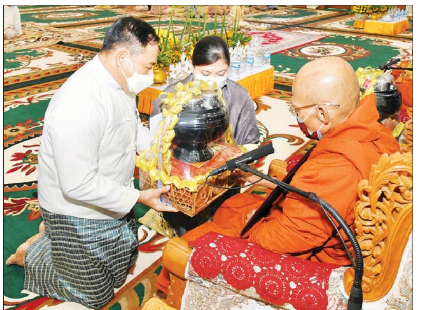
နိုင်ငံတော်စီမံအုပ်ချုပ်ရေးကောင်စီအဖွဲ့ဝင် ဒုတိယဗိုလ်ချုပ်ကြီး ရာပြည့်နှင့် ဇနီးတို့ ဆရာတော်ထံ ကထိန်သင်္ကန်းနှင့် လှူဖွယ်ပစ္စည်းများ ဆက်ကပ်လှူဒါန်းစဉ်။

ကထိန်လျာသင်္ကန်း၊ လှူဖွယ်ပစ္စည်းများနှင့် ပဒေသာပင်များအား လှည့်လည်ကြည့်ရှုကြသည်။ ထို့နောက် နိုင်ငံတော်စီမံအုပ်ချုပ်ရေးကောင်စီဥက္ကဋ္ဌ တပ်မတော်ကာကွယ်ရေးဦးစီးချုပ်နှင့် ဇနီး