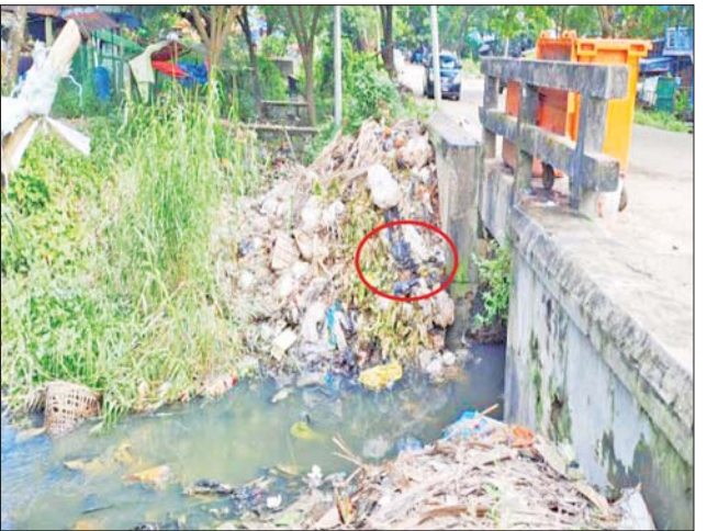
၂၀၂၂ ခုနှစ် အောက်တိုဘာ ၁၄ ရက်တွင် ဒလမြို့နယ် မဟာဗန္ဓုလလမ်းနှင့် တံတားဖြူရေမြောင်းအနီးရှိ အမှိုက်ပုံ၌ လက်လုပ်ခိုင်းပေါက်ကွဲမှု မှတ်တမ်းဓာတ်ပုံ။