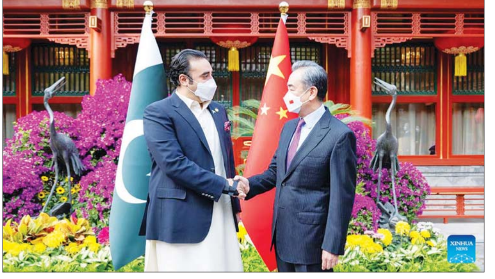
ပါကစ္စတန်နိုင်ငံခြားရေးဝန်ကြီး ဘီလဝါ ဘူတိုဇာဒါရီနှင့် တရုတ်နိုင်ငံခြားရေးဝန်ကြီး ဝမ်ယီ။

ကြောင်း၊ တရုတ်နိုင်ငံအနေဖြင့် တရုတ် - ပါကစ္စတန် စီးပွားရေး စင်္ကြံ၏ အရည်အသွေးမြင့် ဖွံ့ဖြိုးတိုးတက်မှုကို မြှင့်တင်ရန် ပါကစ္စတန်နိုင်ငံနှင့်အတူ လုပ်ဆောင်ရန် အသင့်ရှိကြောင်း ၎င်းက ပြောကြားသည်။ ဆင်ဟွာ