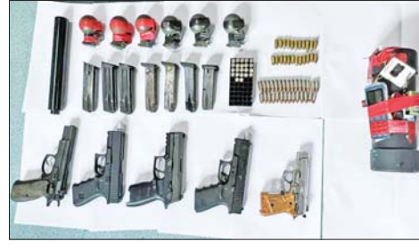
၂၀၂၂ ခုနှစ် အောက်တိုဘာ ၁၈ ရက်တွင် ဒေါပုံမြို့နယ် သင်္ဘောကျင်းရပ်ကွက် သင်္ဘောကျင်း (၈) လမ်း၌ တရားခံနှင့်အတူ ဖမ်းဆီးရမိသည့် လက်နက်/ခဲယမ်းများ မှတ်တမ်းဓာတ်ပုံ။