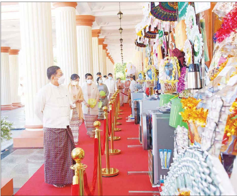
နိုင်ငံတော်စီမံအုပ်ချုပ်ရေးကောင်စီဥက္ကဋ္ဌ တပ်မတော်ကာကွယ်ရေးဦးစီးချုပ် ဗိုလ်ချုပ်မှူးကြီး မင်းအောင်လှိုင်၊ ဇနီး ဒေါ်ကြူကြူလှနှင့် အဖွဲ့ဝင်များ ဘုန်းတော်ကြီးကျောင်းအသီးသီးသို့ လှူဒါန်းရန် ခင်းကျင်းပြင်ဆင်ထားသည့် ကထိန်လျာသင်္ကန်း၊ လှူဖွယ်ပစ္စည်းများနှင့် ပဒေသာပင်များအား လှည့်လည်ကြည့်ရှုစဉ်။