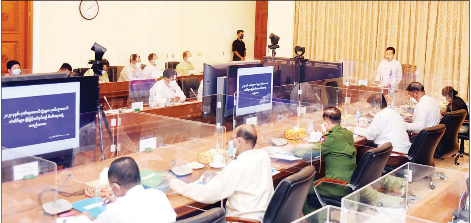
နိုင်ငံတော်စီမံအုပ်ချုပ်ရေးကောင်စီ ဒုတိယဥက္ကဋ္ဌ ဒုတိယဝန်ကြီးချုပ် ဒုတိယဗိုလ်ချုပ်မှူးကြီး စိုးဝင်း ၂၀၂၃ ခုနှစ်အတွက် ဂုဏ်ထူးဆောင်ဘွဲ့များ၊ ဂုဏ်ထူးဆောင်တံဆိပ်များ ချီးမြှင့်အပ်နှင်းရန် စိစစ်ရေးအဖွဲ့အစည်းအဝေးတွင် အမှာစကားပြောကြားစဉ်။

နေပြည်တော် နိုဝင်ဘာ ၃ ၂၀၂၃ ခုနှစ်အတွက် ဂုဏ်ထူးဆောင်ဘွဲ့များ၊ ဂုဏ်ထူးဆောင်တံဆိပ်များ ချီးမြှင့်အပ်နှင်းရန် စိစစ်ရေးအဖွဲ့ အစည်းအဝေးကို ယနေ့ မွန်းလွဲ ၂ နာရီတွင် နေပြည်တော်ရှိ နိုင်ငံတော်စီမံအုပ်ချုပ်ရေးကောင်စီ ဥက္ကဋ္ဌရုံး အစည်းအဝေးခန်းမ၌ ကျင်းပရာ ၂၀၂၃ ခုနှစ်အတွက် ဂုဏ်ထူးဆောင်ဘွဲ့များ၊ ဂုဏ်ထူးဆောင်တံဆိပ်များ ချီးမြှင့်အပ်နှင်းရန် စိစစ်ရေးအဖွဲ့နာယက နိုင်ငံတော်စီမံအုပ်ချုပ်ရေးကောင်စီ ဒုတိယဥက္ကဋ္ဌ ဒုတိယဝန်ကြီးချုပ် ဒုတိယဗိုလ်ချုပ်မှူးကြီး စိုးဝင်း တက်ရောက် အမှာစကား ပြောကြားသည်။ အစည်းအဝေးသို့ ဂုဏ်ထူးဆောင်ဘွဲ့များ၊ ဂုဏ်ထူးဆောင်တံဆိပ်များ ချီးမြှင့်အပ်နှင်းရန် စာမျက်နှာ ၈ ကော်လံ ၁