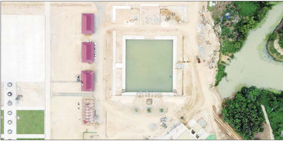
မုစလိန္နအိုင်နှင့် နဂါးရုံဘုရား တည်ဆောက်ခြင်းလုပ်ငန်း ၂၀၂၂ ခုနှစ် ဩဂုတ်လ ဆောင်ရွက်ပြီးစီးမှု။