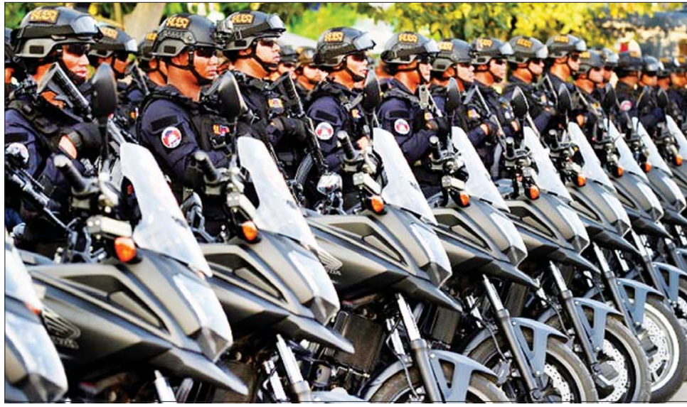
ကမ္ဘောဒီးယားလုံခြုံရေးတပ်ဖွဲ့ဝင်များကို တွေ့ရစဉ်။

ဖနောင်ပင် နိုဝင်ဘာ ၃ လာမည့်အာဆီယံထိပ်သီးအစည်းအဝေးနှင့် ဆက်စပ်အစည်းအဝေးများအတွင်း လုံခြုံရေးနှင့် ပြည်သူ့လူထု၏ အိုးအိမ်စည်းစိမ်ကို ထိန်းသိမ်းရန် လုံခြုံရေးတပ်ဖွဲ့ဝင် ၁၂၀၀၀ ကျော် ဖြန့်ကြက်ချသွားမည်ဖြစ်ကြောင်း ကမ္ဘောဒီးယားနိုင်ငံ ဒုတိယရဲချုပ်နှင့် ပြောရေးဆိုခွင့်ရှိသူ ဒုတိယဗိုလ်ချုပ်ကြီး ချက်ဟေးကင်ခိုအန်း က နိုဝင်ဘာ ၃ ရက်တွင် ပြောကြားလိုက်သည်။