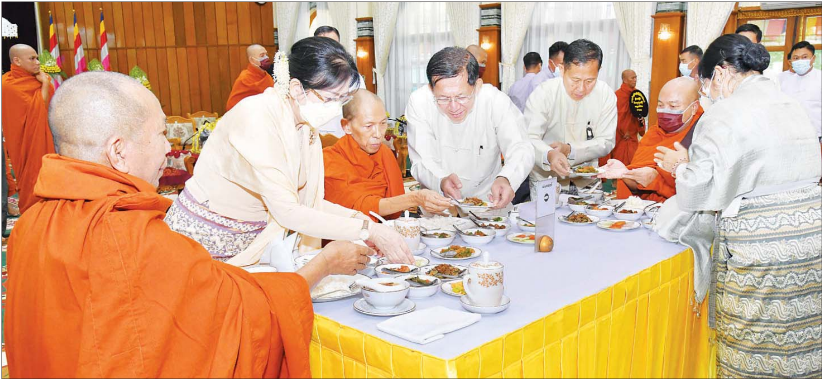
နိုင်ငံတော်စီမံအုပ်ချုပ်ရေးကောင်စီဥက္ကဋ္ဌ တပ်မတော်ကာကွယ်ရေးဦးစီးချုပ် ဗိုလ်ချုပ်မှူးကြီး မင်းအောင်လှိုင်နှင့် ဇနီး ဒေါ်ကြူကြူလှ၊ နိုင်ငံတော်စီမံအုပ်ချုပ်ရေးကောင်စီ ဒုတိယဥက္ကဋ္ဌ ဒုတိယတပ်မတော်ကာကွယ်ရေးဦးစီးချုပ် ကာကွယ်ရေးဦးစီးချုပ် (ကြည်း) ဒုတိယဗိုလ်ချုပ်မှူးကြီး စိုးဝင်းနှင့် ဇနီး ဒေါ်သန်းသန်းနွယ်တို့ ဆရာတော် သံဃာတော်များအား နေ့ဆွမ်းဆက်ကပ်လှူဒါန်းစဉ်။

နေ့ဆွမ်းဆက်ကပ် ထို့နောက် အခမ်းအနားကို “ဗုဒ္ဓသာသနံ စိရံတိဋ္ဌတု” သုံးကြိမ် ရွတ်ဆိုဆုတောင်း၍ ရုပ်သိမ်းပြီး မဟာဘုံကထိန် အလှူတော် မင်္ဂလာ အခမ်းအနား အောင်မြင်ခြင်း အထိမ်းအမှတ်အဖြစ် ရတနာရွှေမိုး၊ ငွေမိုးများ ရွာသွန်းပြီးကြ