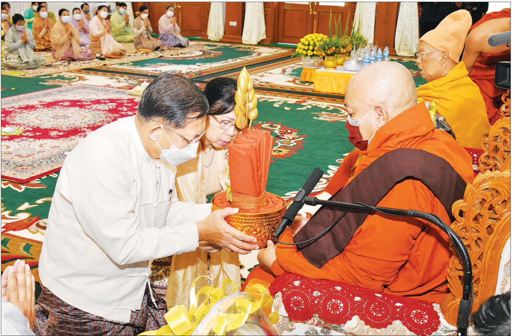
နိုင်ငံတော်စီမံအုပ်ချုပ်ရေးကောင်စီဥက္ကဋ္ဌ တပ်မတော်ကာကွယ်ရေးဦးစီးချုပ် ဗိုလ်ချုပ်မှူးကြီး မင်းအောင်လှိုင် နှင့် ဇနီး ဒေါ်ကြူကြူလှ တို့ နေပြည်တော် ဇေယျာသီရိမြို့နယ် ရေဆင်း ကန်ဦးကျောင်းတိုက် ပဓာနနာယက အဂ္ဂမဟာဂန္ထဝါစက ပဏ္ဍိတ ဘဒ္ဒန္တ ဝိလသ ထံ ကထိန်လျာသင်္ကန်း ဆက်ကပ်လှူဒါန်းစဉ်။

အဆိုပါ အခမ်းအနားသို့ ဥပ္ပါတသန္တိစေတီတော် ဂေါပကအဖွဲ့၊ ဩဝါဒါစရိယ ဆရာတော် နေပြည်တော် လယ်ဝေးမြို့ပေါက်မြိုင်ကျောင်းတိုက် ပဓာနနာယက အဘိဓမ္မမဟာရဋ္ဌဂုရု ဘဒ္ဒန္တဇနိန္ဒာ၊ ပျဉ်းမနားမြို့ ပါဠိတက္ကသိုလ်မင်္ဂလာဇေယျကျောင်းတိုက် ပဓာနနာယက အဂ္ဂမဟာပဏ္ဍိတ၊ အဂ္ဂမဟာ သဒ္ဓမ္မဇောတိကဓဇ ဘဒ္ဒန္တ ဝိမလဗုဒ္ဓိ စာမျက်နှာ ၃ ကော်လံ ၁၀