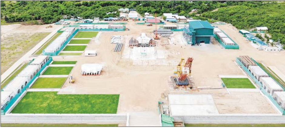
မာရဝိဇယဗုဒ္ဓရုပ်ပွားတော်မြတ်ကြီးပြီးစီးမှုကို ၅-၈-၂၀၂၂ ရက်က တွေ့ရစဉ်။