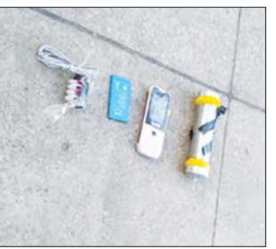
၂၀၂၂ ခုနှစ် ဇွန် ၂၀ ရက်တွင် ဒလမြို့နယ် တပင်ရွှေထီးရပ်ကွက် အထက (၄) ကျောင်းအနီး၌ လက်လုပ်ခိုင်းပေါက်ကွဲမှု မှတ်တမ်းဓာတ်ပုံ။

၂၀၂၂ ခုနှစ် ဩဂုတ် ၁၄ ရက်တွင် ဒလမြို့နယ် စက်မြေရပ်ကွက် မင်းရဲကျော်စွာလမ်း၌ အပြစ်မဲ့ပြည်သူ တစ်ဦး လုပ်ကြံသတ်ဖြတ်ခြင်းခံခဲ့ရသည့် မှတ်တမ်းဓာတ်ပုံ။