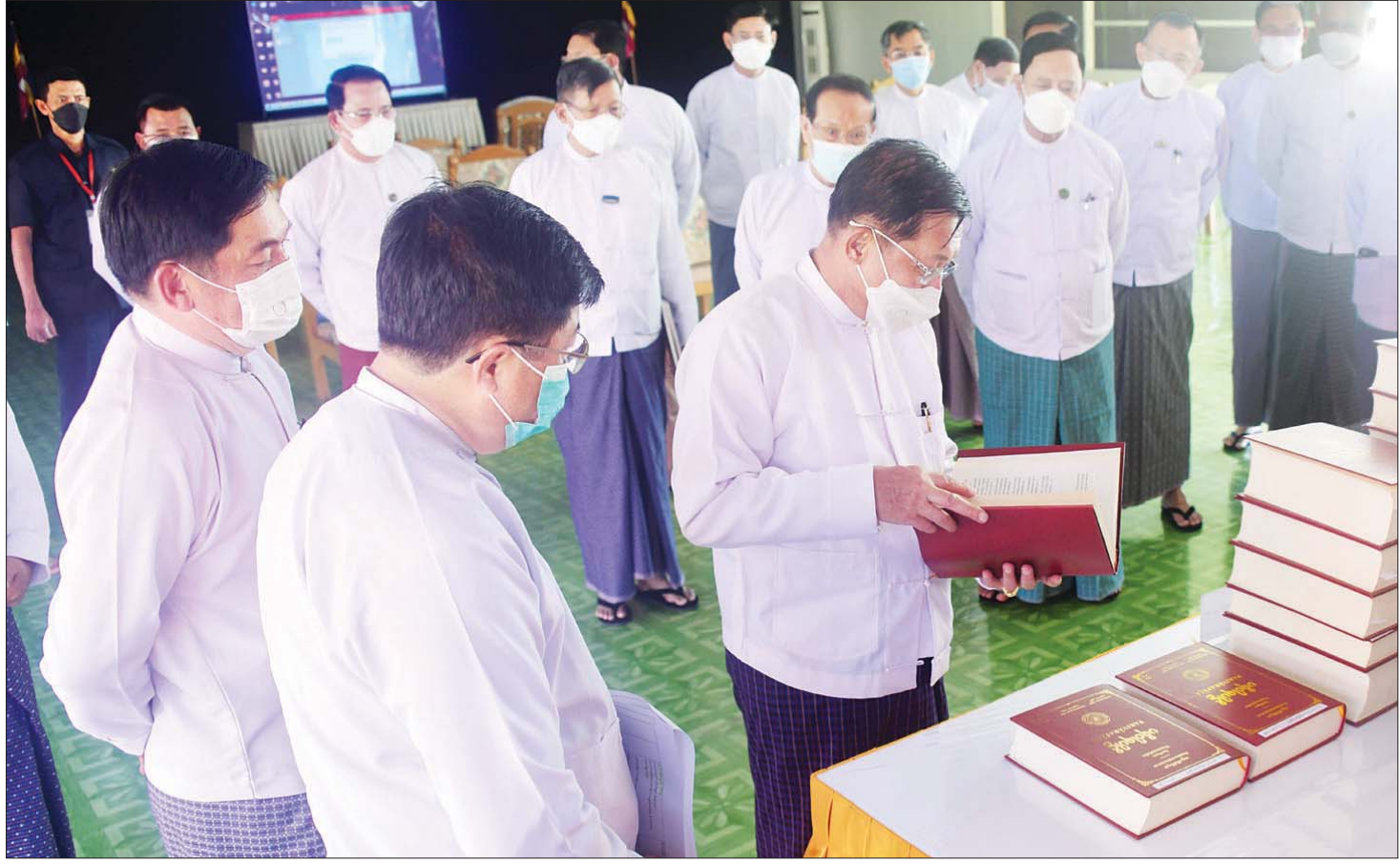
နိုင်ငံတော်စီမံအုပ်ချုပ်ရေးကောင်စီဥက္ကဋ္ဌ နိုင်ငံတော်ဝန်ကြီးချုပ် ဗိုလ်ချုပ်မှူးကြီး မင်းအောင်လှိုင် ကမ္ဘာပေါ်ရှိ ဘုန်းတော်ကြီးကျောင်းများသို့ ဖြန့်ဝေရန်အတွက် ပါဠိအက္ခရာနှင့် Romanize Language တို့ဖြင့် ရိုက်နှိပ်ထားသော ပိဋကတ်ကျမ်းစာအုပ်နမူနာများကို ကြည့်ရှုစဉ်။

❖ “မာရဝိဇယ ဗုဒ္ဓရုပ်ပွားတော်မြတ်ကြီး” အား တည်ထားကိုးကွယ်ပြီးစီးပါက မြန်မာတွင်သာမက ကမ္ဘာ့နိုင်ငံများတွင်ပါ စကျင်ကျောက်တော်ကြီးဖြင့် ထုဆစ်သည့် ဆင်းတုတော်ကြီးများအနက် အကြီးဆုံးနှင့် ဉာဏ်တော်အမြင့်မားဆုံး ဆင်းတုတော်ကြီးဖြစ်လာမည်