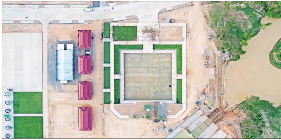
မုစလိန္နအိုင်နှင့် နဂါးရုံဘုရား တည်ဆောက်ခြင်းလုပ်ငန်း ၂၀၂၂ ခုနှစ် နိုဝင်ဘာလ ဆောင်ရွက်ပြီးစီးမှု။