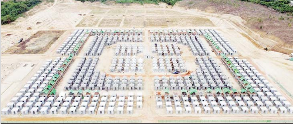
ကျောက်စာစေတီ တည်ဆောက်ခြင်းလုပ်ငန်း ၂၀၂၂ ခုနှစ် ဩဂုတ်လ ဆောင်ရွက်ပြီးစီးမှု။