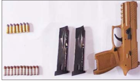
၂၀၂၂ ခုနှစ် အောက်တိုဘာ ၁၉ ရက်တွင် ဒဂုံမြို့နယ် (တောင်ပိုင်း)မြို့နယ် (၂၅)ရပ်ကွက် ယုဇန(၄) လမ်း၌ တရားခံနှင့်အတူ ဖမ်းဆီးရမိသည့် လက်နက်/ခဲယမ်းများ မှတ်တမ်းဓာတ်ပုံ။