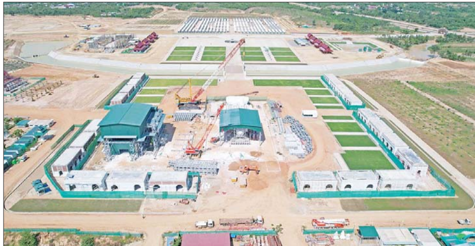
၂၀၂၂ ခုနှစ် နိုဝင်ဘာလ ရင်ပြင်တော်ရှိ လုပ်ငန်းဆောင်ရွက်ပြီးစီးမှု။