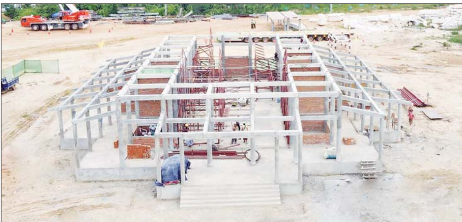
ကျောင်းဆောင်တော် တည်ဆောက်ခြင်းလုပ်ငန်း ၂၀၂၂ ခုနှစ် ဩဂုတ်လ ဆောင်ရွက်ပြီးစီးမှု။