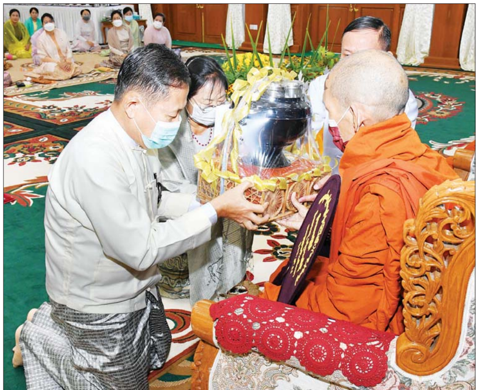
နိုင်ငံတော်စီမံအုပ်ချုပ်ရေးကောင်စီ ဒုတိယဥက္ကဋ္ဌ ဒုတိယတပ်မတော်ကာကွယ်ရေးဦးစီးချုပ် ကာကွယ်ရေးဦးစီးချုပ် (ကြည်း) ဒုတိယဗိုလ်ချုပ်မှူးကြီး စိုးဝင်းနှင့် ဇနီး ဒေါ်သန်းသန်းနွယ်တို့ ပါဠိတက္ကသိုလ် မင်္ဂလာဇေယျကျောင်းတိုက် ပဓာနနာယကဆရာတော်ကြီးထံ ကထိန်သင်္ကန်းနှင့် လှူဖွယ်ပစ္စည်းများ ဆက်ကပ်လှူဒါန်းစဉ်။