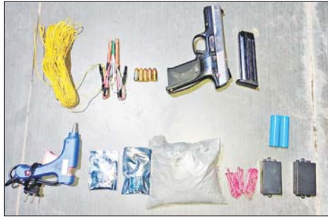
၂၀၂၂ ခုနှစ် အောက်တိုဘာ ၂၂ ရက်တွင် အင်းစိန်မြို့နယ် ကြို့ကုန်းအရှေ့ရပ်ကွက် မဟာသုတိသာ လမ်းသွယ်(၁) တိုက်အမှတ်(5/A)၌ သိမ်းဆည်းရမိခဲ့သည့် လက်နက်/ခဲယမ်းများနှင့် ဖောက်ခွဲရေး ဆက်စပ် ပစ္စည်းများ၏ မှတ်တမ်းဓာတ်ပုံ။