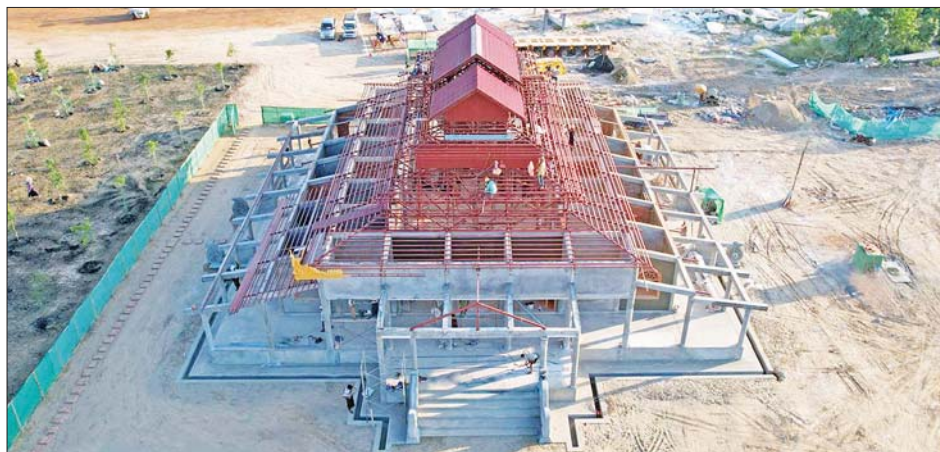
ကျောင်းဆောင်တော် တည်ဆောက်ခြင်းလုပ်ငန်း ၂၀၂၂ ခုနှစ် နိုဝင်ဘာလ ဆောင်ရွက်ပြီးစီးမှု။