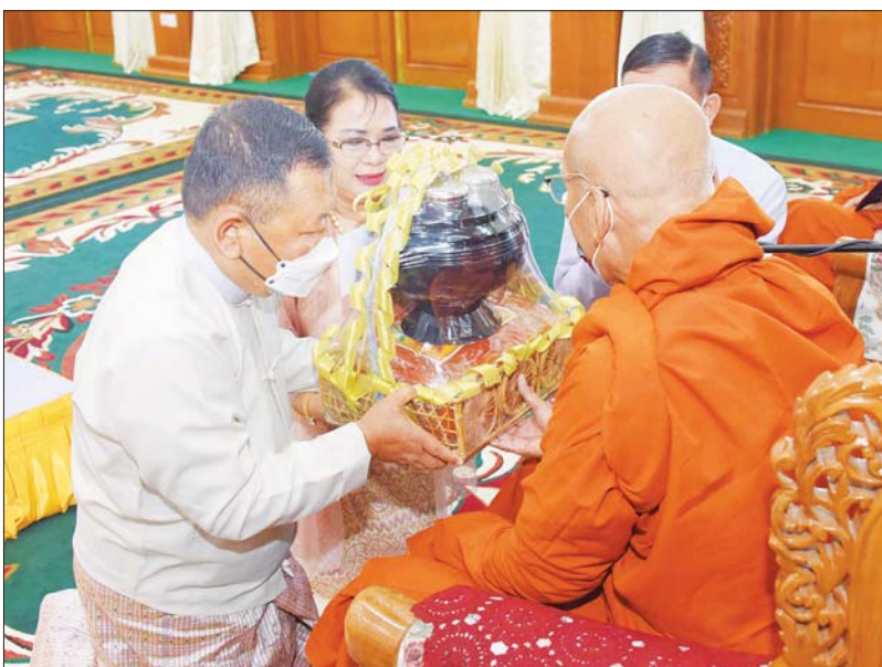
နိုင်ငံတော်စီမံအုပ်ချုပ်ရေးကောင်စီ အဖွဲ့ဝင် ဒုတိယဗိုလ်ချုပ်ကြီး စိုးထွဋ်နှင့် ဇနီး တို့ ဆရာတော်ထံ ကထိန်သင်္ကန်းနှင့် လှူဖွယ်ပစ္စည်းများ ဆက်ကပ်လှူဒါန်းစဉ်။

ဦးစွာ နိုင်ငံတော်စီမံအုပ်ချုပ်ရေးကောင်စီဥက္ကဋ္ဌ တပ်မတော်ကာကွယ်ရေးဦးစီးချုပ်၊ ဇနီးနှင့် ဧည့်ပရိသတ်များသည် ဘုန်းတော်ကြီးကျောင်းအသီးသီးသို့ လှူဒါန်းရန် ခင်းကျင်းပြင်ဆင်ထားသည့်