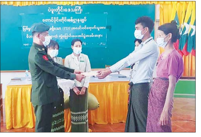
စည်းကမ်းချက်များနှင့်အညီ ဥပဒေဘောင်အတွင်းသို့ လက်နက်အပ်နှံပြီး ပြည်သူ့ဘဝသို့ ပြန်လည်ဝင်ရောက်ခြင်းပြုမည်ဆိုပါက ကြိုဆိုလက်ခံ သွားမည်ဖြစ်ကြောင်း နိုင်ငံတော်အစိုးရက ထုတ်ပြန်ထားပြီးဖြစ်ရာ ပြစ်မှုကျူးလွန်ခြင်းမရှိသော PDF အဖွဲ့ဝင်များက တိုင်းဒေသကြီးနှင့် ပြည်နယ်အသီးသီး၌ ဥပဒေဘောင်အတွင်း ပြန်လည်ဝင်ရောက်လျက် ရှိကြသဖြင့် သက်ဆိုင်ရာတာဝန်ရှိသူများက ၎င်းတို့၏ မိဘအုပ်ထိန်းသူ များထံသို့ လွှဲပြောင်းပေးအပ်ပေးလျက်ရှိကြောင်း သတင်းရရှိသည်။

နေပြည်တော် နိုဝင်ဘာ ၃ တိုင်းရင်းသားလက်နက်ကိုင်အဖွဲ့ နယ်မြေအတွင်း သင်တန်းများ တက်ရောက်ခဲ့ပြီး ပြစ်မှုကျူးလွန်ခြင်းမရှိခဲ့သည့် ဥပဒေဘောင်အတွင်း ဝင်ရောက်လာသော PDF အဖွဲ့ဝင်များအား ပြန်လည်ကြိုဆိုလက်ခံ၍ ၎င်း၏မိဘအုပ်ထိန်းသူများထံသို့ လွှဲပြောင်းပေးအပ်လျက်ရှိသည်။ ယနေ့နံနက်ပိုင်းတွင် ပဲခူးတိုင်းဒေသကြီး ရေတာရှည်မြို့ အထွေထွေ အုပ်ချုပ်ရေးဦးစီးဌာန အစည်းအဝေးခန်းမ၌ ပြန်လည်ကြိုဆိုလက်ခံခြင်း အခမ်းအနားကို ပြုလုပ်ရာ တောင်ပိုင်းတိုင်းစစ်ဌာနချုပ်၊ ရေတာရှည် တပ်နယ်မှ တာဝန်ရှိသူများ၊ ခရိုင်/မြို့နယ် စီမံအုပ်ချုပ်ရေးအဖွဲ့ဝင်များ၊ ဌာနဆိုင်ရာတာဝန်ရှိသူများ၊ ဥပဒေဘောင်အတွင်း ဝင်ရောက်လာသူနှင့် ၎င်း၏မိဘအုပ်ထိန်းသူများ တက်ရောက်ကြသည်။ ဦးစွာ တာဝန်ရှိသူ များက နယ်မြေဒေသတည်ငြိမ်အေးချမ်းရေးနှင့် တရားဥပဒေဆိုင်ရာ ပုဒ်မများကို ရှင်းလင်းဆွေးနွေးပြောကြားသည်။ ထို့နောက် ဥပဒေ ဘောင်အတွင်း ပြန်လည်ဝင်ရောက်ခဲ့သည့် ပြစ်မှုကျူးလွန်ခြင်းမရှိခဲ့သော ရေတာရှည်မြို့နယ်မှ PDF အဖွဲ့ဝင် အမျိုးသား တစ်ဦးကို ဝန်ခံကတိ လက်မှတ်ရေးထိုးစေကာ ထောက်ပံ့ပစ္စည်းများပေးအပ်ပြီး ၎င်းတို့၏ မိဘအုပ်ထိန်းသူများထံသို့ လွှဲပြောင်းပေးအပ်ပေးသည်။ PDF အပါအဝင် အဖွဲ့အစည်းအမျိုးမျိုးတို့အနေဖြင့် နိုင်ငံတော်၏ ရှေ့လုပ်ငန်းစဉ်များတွင် ပါဝင်ပူးပေါင်းဆောင်ရွက်နိုင်ရေး သတ်မှတ်