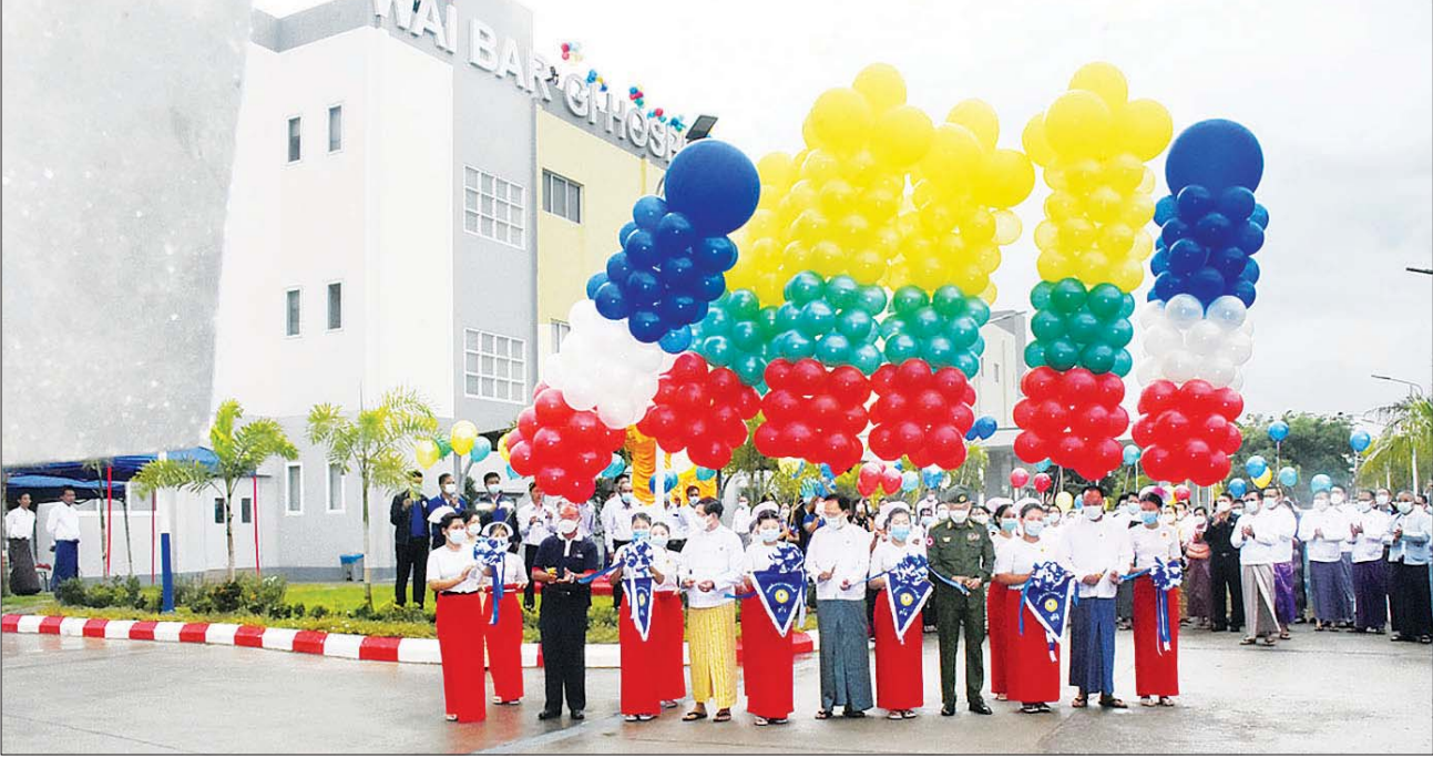
ဝေဘာဂီအထူးကုဆေးရုံကြီး အဆင့်မီဆေးကုသဆောင်သစ် ဖွင့်ပွဲအခမ်းအနားကျင်းပ