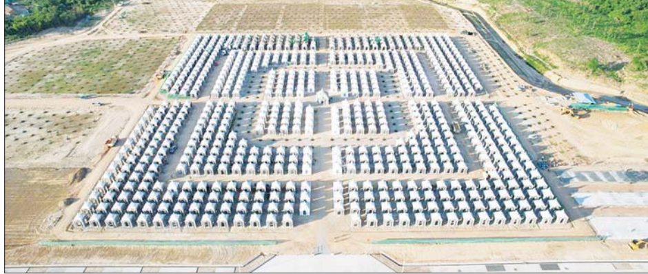
ကျောက်စာစေတီ တည်ဆောက်ခြင်းလုပ်ငန်း ၂၀၂၂ ခုနှစ် နိုဝင်ဘာလ ဆောင်ရွက်ပြီးစီးမှု။