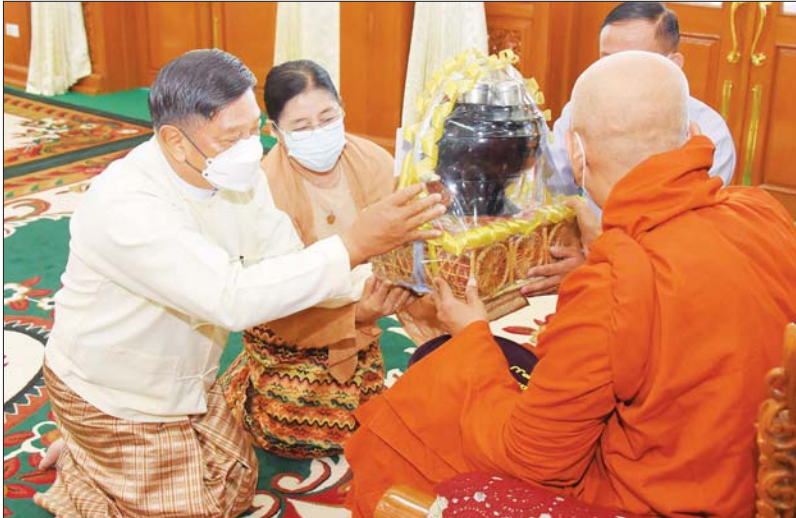
နိုင်ငံတော်စီမံအုပ်ချုပ်ရေးကောင်စီ အဖွဲ့ဝင် ဗိုလ်ချုပ်ကြီး တင်အောင်စန်းနှင့် ဇနီးတို့ ဆရာတော်ထံ ကထိန်သင်္ကန်းနှင့် လှူဖွယ်ပစ္စည်းများ ဆက်ကပ်လှူဒါန်းစဉ်။