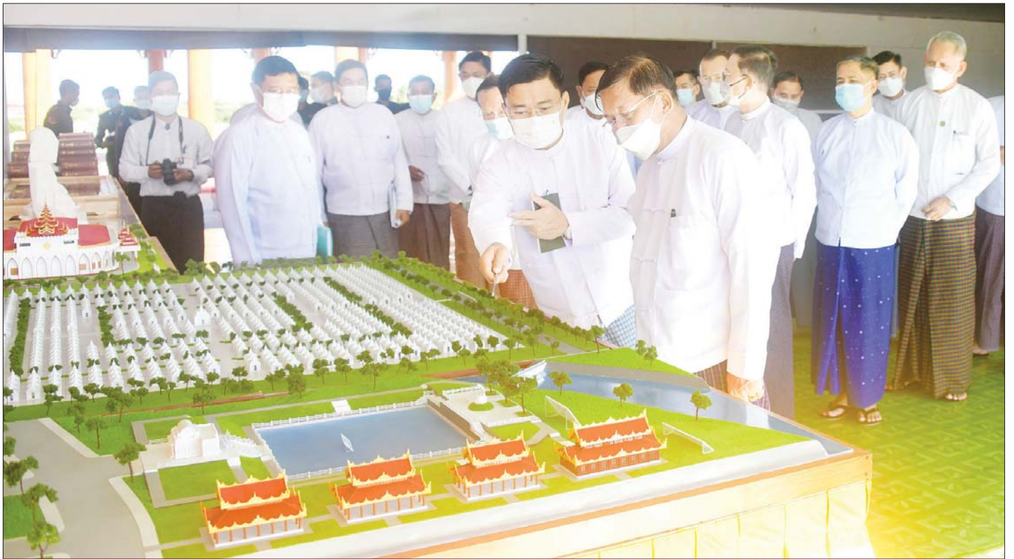
နိုင်ငံတော်စီမံအုပ်ချုပ်ရေးကောင်စီဥက္ကဋ္ဌ နိုင်ငံတော်ဝန်ကြီးချုပ် ဗိုလ်ချုပ်မှူးကြီး မင်းအောင်လှိုင်နှင့် အဖွဲ့ဝင်များ ခင်းကျင်းပြသထားသော အဆောက်အအုံပုံစံငယ်များကို ကြည့်ရှုစဉ်။

ဦးစွာ ဦးဆောင်ဘုရားဒါယကာ နိုင်ငံတော်စီမံအုပ်ချုပ်ရေးကောင်စီဥက္ကဋ္ဌ နိုင်ငံတော်ဝန်ကြီးချုပ် ဗိုလ်ချုပ်မှူးကြီး မင်းအောင်လှိုင်၊ ကောင်စီတွဲဖက်အတွင်းရေးမှူး ဒုတိယဗိုလ်ချုပ်ကြီး ရဲဝင်းဦး၊ ပြည်ထောင်စုဝန်ကြီးများနှင့် တပ်မတော်အရာရှိကြီးများကို ရှင်းလင်းဆောင်၌ ကာကွယ်ရေးဦးစီးချုပ်ရုံး (ကြည်း) မှ ဒုတိယဗိုလ်ချုပ်ကြီး ကဲမြင့်သန်းက မာရဝိဇယဗုဒ္ဓရုပ်ပွားတော်မြတ်ကြီးအား ပင့်ထောင်ခြင်း၊ ပင့်တင်ခြင်းနှင့် ပလောင်တော်ပေါ်သို့ ပင့်ဆောင်ခြင်းများဆောင်ရွက်မည့် အခြေအနေများကို လည်းကောင်း၊ ဒုတိယဗိုလ်ချုပ်ကြီး ကျော်စွာလင်းက မာရဝိဇယဗုဒ္ဓရုပ်ပွားတော်ကြီးအတွင်း စိမ်းလန်းစိုပြည်သာယာလှပစေရေးအတွက် သစ်ပင်၊ ပန်းမန်များ စိုက်ပျိုးဆောင်ရွက်နေမှု၊ သာသနိက အဆောက်အအုံများ ဆောက်လုပ်နေမှုနှင့် အဆင့်ဆင့်တိုးတက်လာမှုအခြေအနေများကိုလည်းကောင်း၊ ဒုတိယဗိုလ်ချုပ်ကြီး ညိုစောက ဆဋ္ဌသင်္ဂါယနာမူ ပိဋကတ်ကျမ်းစာတော်များကို ဆရာတော်ကြီးများ၏