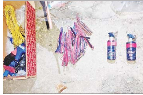
၂၀၂၂ ခုနှစ် အောက်တိုဘာ ၂၂ ရက်တွင် အင်းစိန်မြို့နယ် ကြို့ကုန်းအရှေ့ရပ်ကွက် မဟာသုတိသာ လမ်းသွယ်(၁) တိုက်အမှတ်(5/A)၌ သိမ်းဆည်းရမိခဲ့သည့် လက်နက်/ခဲယမ်းများနှင့် ဖောက်ခွဲရေး ဆက်စပ် ပစ္စည်းများ၏ မှတ်တမ်းဓာတ်ပုံ။