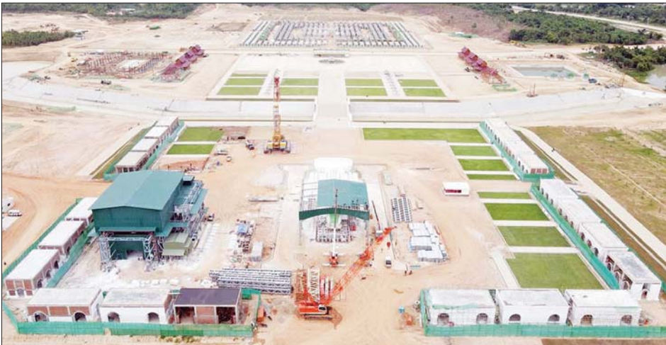
၂၀၂၂ ခုနှစ် ဩဂုတ်လ ရင်ပြင်တော်ရှိ လုပ်ငန်းဆောင်ရွက်ပြီးစီးမှု။