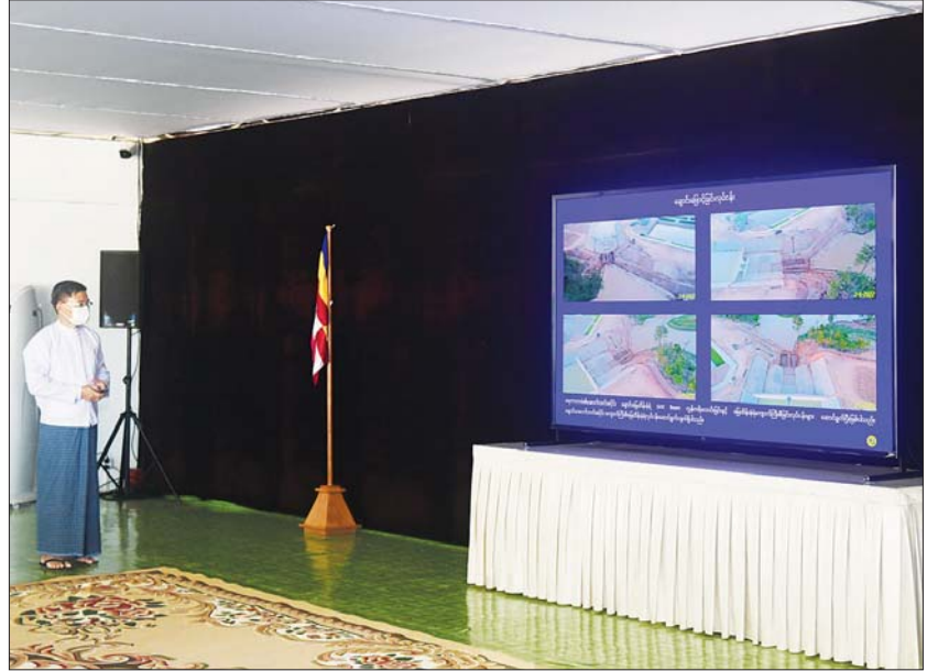
နိုင်ငံတော်စီမံအုပ်ချုပ်ရေးကောင်စီဥက္ကဋ္ဌ နိုင်ငံတော်ဝန်ကြီးချုပ် ဗိုလ်ချုပ်မှူးကြီး မင်းအောင်လှိုင် အား တာဝန်ရှိသူတစ်ဦးက ရှင်းလင်းတင်ပြစဉ်။