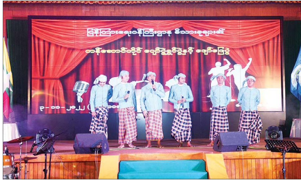
အလ္လီအပြိုင် ဖျော်ဖြေတင်ဆက်စဉ်။

ခေတ်ပေါ်တေးဂီတအဖွဲ့၊ အပြိုင် ပဒေသာတို့နှင့်အတူ နိုင်ငံကျော် တေးသံရှင်များ ပါဝင်သီဆို တင်ဆက်သည့် ဖျော်ဖြေပွဲကို ယနေ့ညနေပိုင်းတွင် နေပြည် တော်ရှိ ပြန်ကြားရေးဝန်ကြီးဌာန စုပေါင်းခန်းမ၌ ကျင်းပသည်။ အဆိုပါ ဖျော်ဖြေပွဲသို့ ပြည်ထောင်စုဝန်ကြီး ဦးမောင် မောင်အုန်းနှင့် ဇနီး၊ ဌာနဆိုင်ရာ အကြီးအကဲများနှင့် ဇနီးများ၊ အရာထမ်း၊ အမှုထမ်းများနှင့် ဝန်ထမ်းမိသားစုဝင်များ ပျော်ရွှင် စွာ ကြည့်ရှုအားပေးကြသည်။ ဂီတဖျော်ဖြေပွဲ မစတင်မီ ပြည်ထောင်စုဝန်ကြီးနှင့် တာဝန် ရှိသူများသည် ဝန်ထမ်းများနှင့် မိသားစုဝင်များအား ရင်းရင်းနှီးနှီး လိုက်လံနှုတ်ဆက်သည်။ ဖျော်ဖြေပွဲတွင် မြန်မာ့အသံ နှင့် ရုပ်မြင်သံကြားမှ ခေတ်ပေါ် တေးဂီတအဖွဲ့နှင့် တွဲဖက်၍ မြန်မာ့အသံမှ တေးသံရှင်များက မြန်မာသံစဉ် တေးသီချင်းများ၊ ခေတ်ပေါ် တေးသီချင်းများဖြင့် လည်းကောင်း၊ နိုင်ငံကျော်အဆို တော် မြန်မာပြည်သိန်းတန်က “ငါသာစော်ဘွားဖြစ်ချင်တယ်” ၊ “မေတ္တာရေလှိုင်း အသည်းပြင်ရိုင်း”၊ “ရွှေသူနာဂီ”၊ “နှင်းပွင့်သစ္စာ”၊ “စနေထောင့်မှာ ပန်းလှူမယ်” စသည့်တေးသီချင်းများဖြင့်လည်း ကောင်း၊ ခေါင်းဆောင်မင်းသမီး မြတ်ဆုချယ်၊ ရှေ့ထွက်မင်းသမီး မြတ်သဇင်သင်း၊ လှရွှင်တော် စောမင်းနောင်၊ ဇော်မင်းထွန်း၊ လင်းဇော်နိုင်၊ ကျော်မင်းစိုး၊ မျိုးကျော်သူနှင့် စိုင်းစည်သူတို့ ပါဝင်သည့် အဓိကအဖွဲ့ဖျော်ဖြေ ခန်းဖြင့်လည်းကောင်း ဖျော်ဖြေ တင်ဆက်ရာ ဝန်ထမ်းများ၊ မိသားစု ဝင်များက ပျော်ရွှင်စွာ ပါဝင် ဆင်နွှဲခဲ့ကြသည်။ ကျန်ဝန်ကြီး ဌာနများနှင့် အဖွဲ့အစည်းအသီးသီး တွင်လည်း နိုဝင်ဘာ ၄ ရက်မှ ၁၂ ရက်အထိ အလှည့်ကျ ဖျော်ဖြေ တင်ဆက်သွားမည်ဖြစ်ကြောင်း သိရသည်။ သတင်းစဉ်