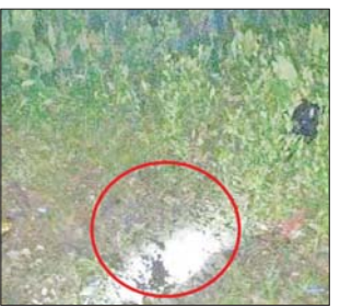
၂၀၂၁ ခုနှစ် မေ ၇ ရက်တွင် ဒလမြို့နယ် ကျန်စစ်သားရပ်ကွက် ဒလ - တွံတေးကားလမ်းဘေးရှိ မြို့နယ် ပညာရေးမှူးရုံးရှေ့၌ လက်လုပ်ခိုင်းပေါက်ကွဲမှု မှတ်တမ်းဓာတ်ပုံ။