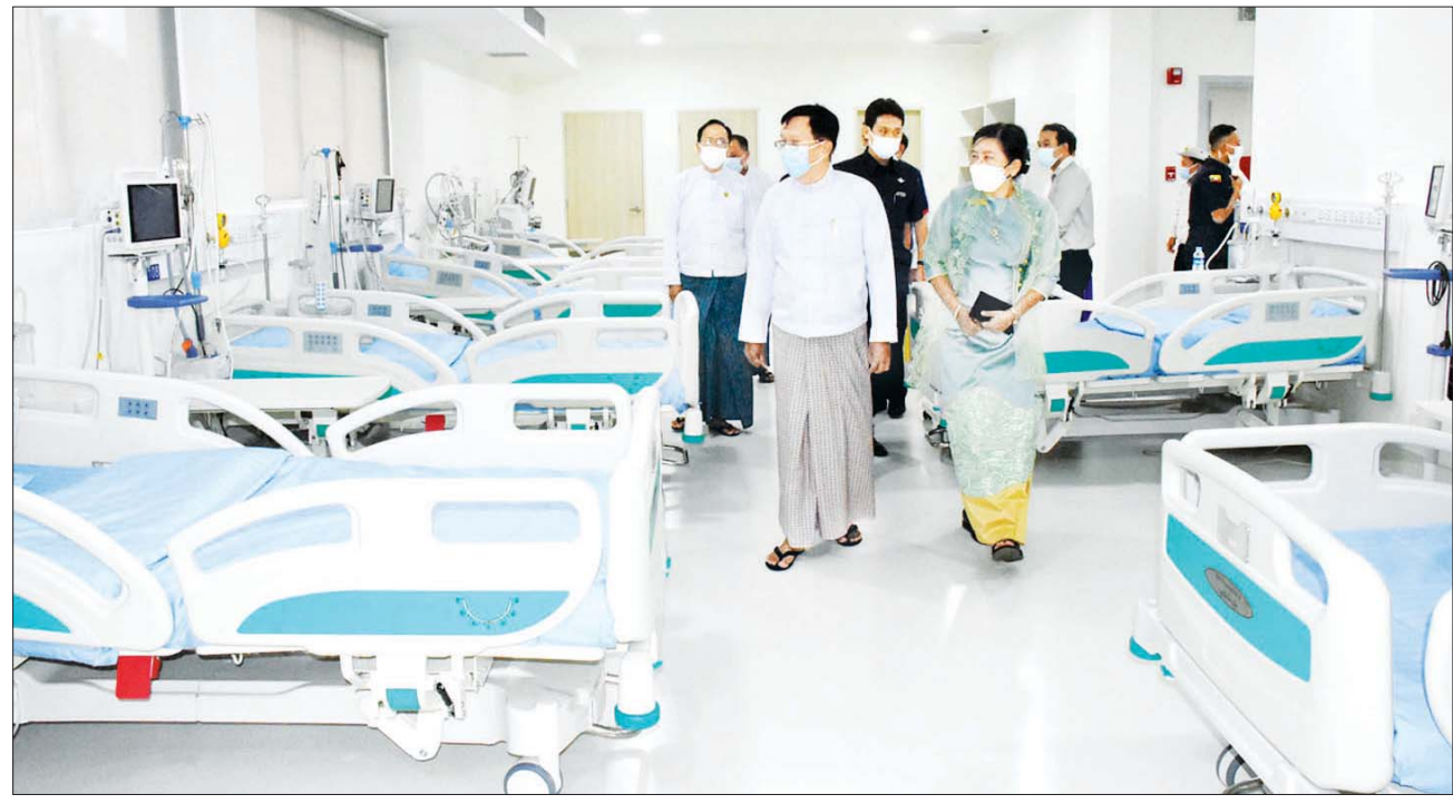
နိုင်ငံတော်စီမံအုပ်ချုပ်ရေးကောင်စီ အတွင်းရေးမှူး ဒုတိယဗိုလ်ချုပ်ကြီး အောင်လင်းဌေး ဝေဘာဂီအထူးကုဆေးရုံကြီး ဆေးကုသဆောင်သစ် အဆောက်အအုံအတွင်း လှည့်လည်ကြည့်ရှုစဉ်။

အဖွင့်အမှာစကားပြောကြား ထို့နောက် ဖွင့်ပွဲအခမ်းအနား မဏ္ဍပ်တွင် နိုင်ငံတော်စီမံအုပ်ချုပ် ရေးကောင်စီ အတွင်းရေးမှူး ဒုတိယဗိုလ်ချုပ်ကြီး အောင်လင်း ဌေးက အဖွင့်အမှာစကား ပြောကြားရာတွင် နိုင်ငံတော် စီမံအုပ်ချုပ်ရေးကောင်စီအနေဖြင့် ကိုဗစ်-၁၉ ကပ်ရောဂါအပြင် ကူးစက်ရောဂါများ၊ မကူးစက်နိုင် သောရောဂါများ ကာကွယ်နိမ်နင်း ရေး၊ ကျေးလက်မြို့ပြ သာတူညီမျှ ကျန်းမာရေး စောင့်ရှောက်မှုများ ရရှိနိုင်ရေး၊ ပြည်သူများ နိုင်ငံ တကာအဆင့်မီ ဆေးဝါးကုသမှု များ ရရှိနိုင်ရေးတို့အတွက် ဦးဆောင်လမ်းညွှန်မှု၊ ပံ့ပိုးမှု များ ဆောင်ရွက်ပေးနေသကဲ့သို့ ကျန်းမာရေးဝန်ထမ်းများ အပါ အဝင် နိုင်ငံဝန်ထမ်းများ၏ လုပ်ငန်းစွမ်းရည်တိုးတက်မြှင့်မား ရေးကိုလည်းဦးတည်ချက်ထားပြီး ဖြည့်ဆည်းဆောင်ရွက်ပေးလျက် ရှိကြောင်း၊ နိုင်ငံတော်စီမံ အုပ်ချုပ်ရေးကောင်စီ၏ ရှေ့ လုပ်ငန်းစဉ် (၅) ရပ်နှင့်အညီ ကိုဗစ်-၁၉ ကပ်ရောဂါ ကာကွယ်၊ ထိန်းချုပ်၊ ကုသရေးလုပ်ငန်းများ ကို အရှိန်အဟုန်မပျက် ဆောင် ရွက်နေပြီး နိုင်ငံတော်စီမံအုပ်ချုပ်