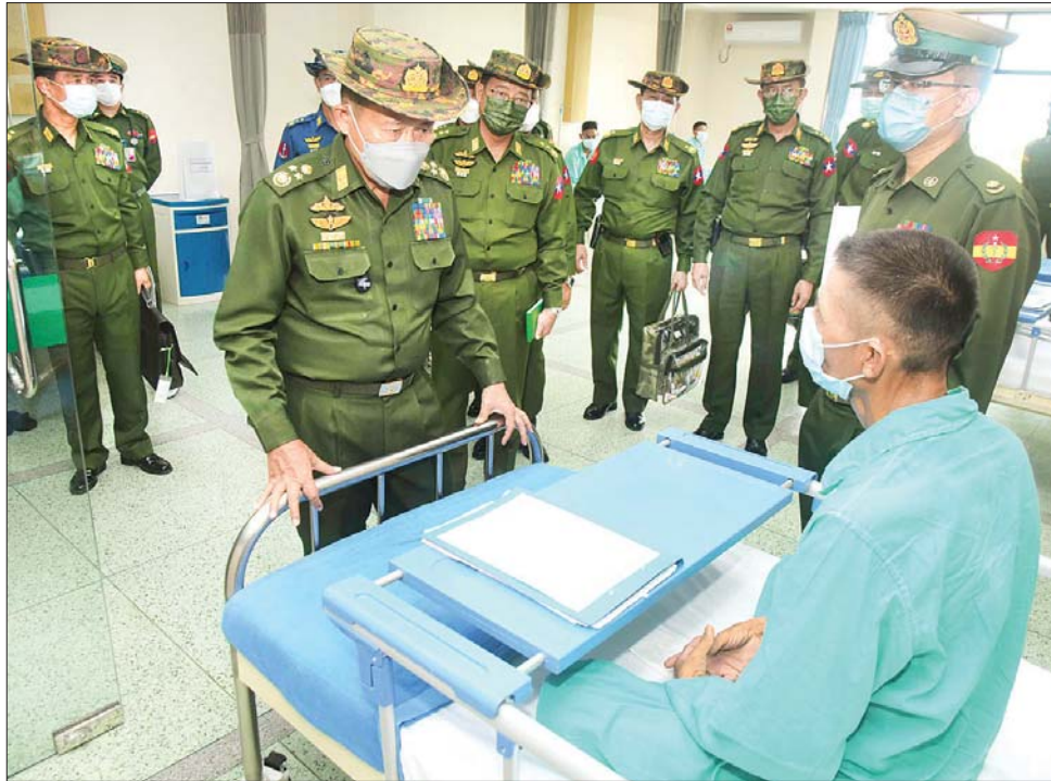
နိုင်ငံတော်စီမံအုပ်ချုပ်ရေးကောင်စီ ဒုတိယဥက္ကဋ္ဌ ဒုတိယတပ်မတော်ကာကွယ်ရေးဦးစီးချုပ် ကာကွယ်ရေး ဦးစီးချုပ်(ကြည်း)ဒုတိယဗိုလ်ချုပ်မှူးကြီး စိုးဝင်း မင်္ဂလာခုံမြို့နယ်ရှိ တပ်မတော်ဆေးရုံကြီး (ခုတင် ၁၀၀၀) ၌ ဆေးကုသမှုခံယူနေသူ တစ်ဦးအား အားပေးစကားပြောကြားစဉ်။