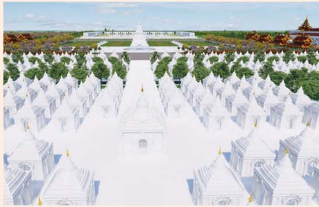
ကျောက်စာရုံစေတီ(၁၂ x ၁၂x ၁၈)ပေ ခု တန်ဖိုး- ၂၇၉ သိန်း