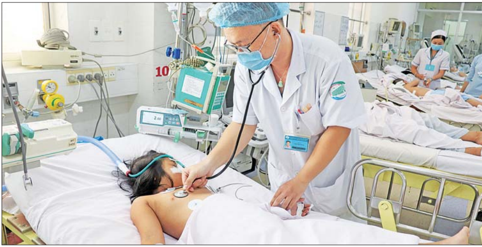
ဗီယက်နမ်နိုင်ငံ၌ သွေးလွန်တုပ်ကွေးရောဂါဖြစ်ပွားနေသည့် ကလေးတစ်ဦးကို တွေ့ရစဉ်။

ဟိုချီမင်းမြို့၌ သွေးလွန်တုပ်ကွေးရောဂါ ကူးစက်သူ ၇၀၀၀ နီးပါးနှင့် သေဆုံးသူ ၂၉ ဦးရှိကာ ကူးစက်မှုအမြင့်ဆုံး