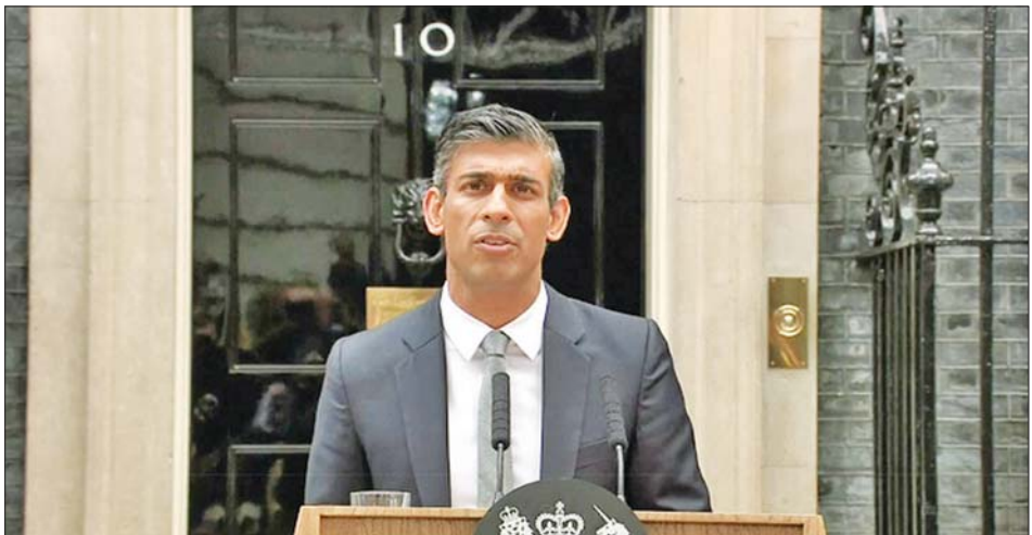
ဗြိတိန်ဝန်ကြီးချုပ်သစ် ရစ်ရှီဆူနက်။

ဗြိတိန်နိုင်ငံသည် ပြီးခဲ့သည့်နှစ်က စီအိုပီ ၂၆ ညီလာခံကို စကော့တလန်တွင် အိမ်ရှင်အဖြစ် ကြောင့် ကမ္ဘာကြီးပူဇွန်လှည့်ပတ်သက်၍ ဗြိတိန် လက်ခံကျင်းပပေးခဲ့ပြီး ရာသီဥတုပြောင်းလဲမှု အစိုးရ၏ ရပ်တည်ချက်အပေါ် မေးခွန်းများ နှင့်ပတ်သက်၍ ကမ္ဘာလုံးဆိုင်ရာ ကြိုးပမ်း ထွက်ပေါ်လာသည်။ အင်န်အိတ်ချ်က