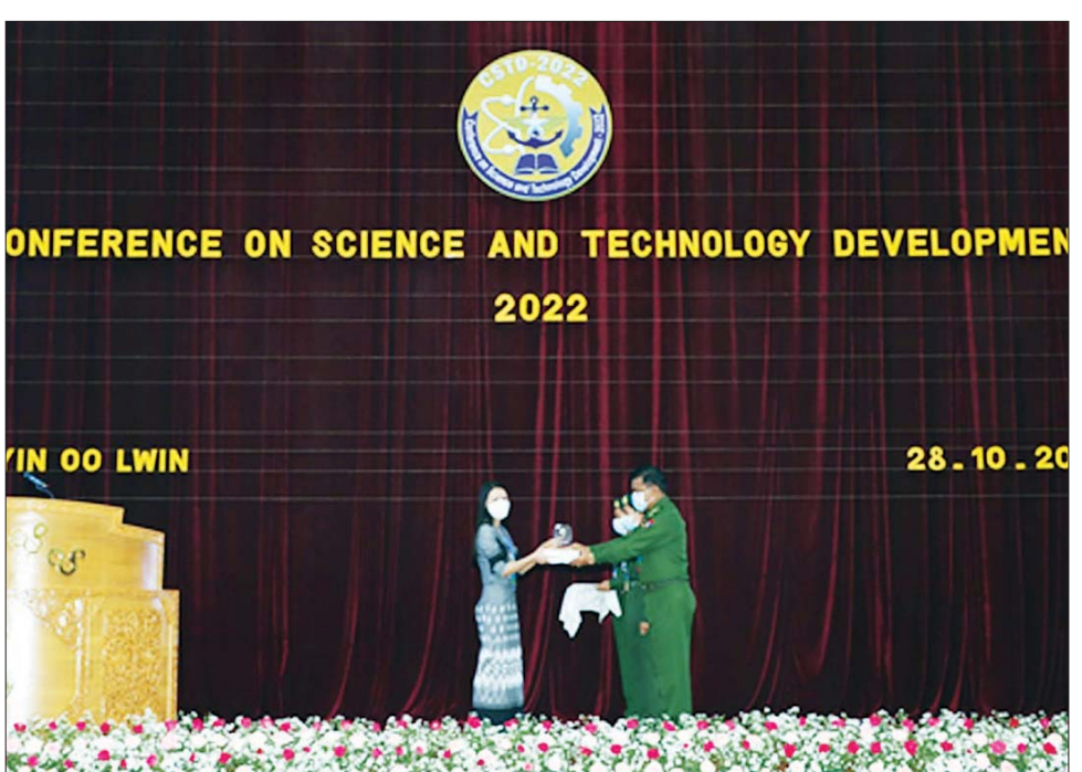
ညှိနှိုင်းကွပ်ကဲရေးမှူးကြီး(ကြည်း၊ ရေ၊ လေ) မောင်မောင်အေးက ပေးအပ်ချီးမြှင့်သည်။ ထိုနောက် ဝန်ထမ်းများမှ ဝန်ထမ်းများမှ ဝန်ထမ်းများမှ ညှိနှိုင်းကွပ်ကဲရေးမှူးကြီး(ကြည်း၊ ရေ၊ လေ) မောင်မောင်အေးက ပေးအပ်ချီးမြှင့်သည်။ နည်းပညာဆိုင်ရာဖွံ့ဖြိုးတိုးတက်ရေးကွန်ဖရင့် (၂၀၂၂) ကို အောင်မြင်စွာ ကျင်းပပြီးစီးခဲ့ကြောင်း သတင်းရရှိသည်။ သတင်းစဉ်

ဆုံး ပိုစတာဆု နှစ်ဆု ပေးအပ်ချီးမြှင့်ခဲ့ရာ တပ်မတော် နည်းပညာ တက္ကသိုလ် ကျောင်းအုပ်ကြီး၊ စစ်တက္ကသိုလ် ကျောင်းအုပ်ကြီးနှင့် ညှိနှိုင်းကွပ်ကဲရေးမှူးကြီး(ကြည်း၊ ရေ၊ လေ)တို့က ပေးအပ်ချီးမြှင့်သည်။ သိပ္ပံနှင့် နည်းပညာဆိုင်ရာ ဖွံ့ဖြိုးတိုးတက်ရေး ကွန်ဖရင့် အောင်မြင်စွာ ကျင်းပနိုင်ရေးအတွက် အရပ်ဘက်တက္ကသိုလ်များက တက်ရောက်ပြီး စာတမ်းဖတ်ကြားခြင်းနှင့် ဆွေးနွေးအကြံပြုခြင်းများ လုပ်ဆောင်ပေးခဲ့ကြသည့် ပါမောက္ခချုပ်များ၊ ပါမောက္ခများနှင့် စာတမ်းရှင်များကို ဂုဏ်ပြုသောအားဖြင့် နိုင်ငံတော်စီမံအုပ်ချုပ်ရေးကောင်စီ ဥက္ကဋ္ဌ၊ တပ်မတော်ကာကွယ်ရေး ဦးစီးချုပ် ဗိုလ်ချုပ်မှူးကြီး မင်းအောင်လှိုင်က ပေးပို့သော ဂုဏ်ပြု လက်ဆောင်များကို