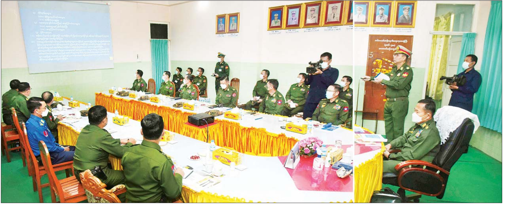
နိုင်ငံတော်စီမံအုပ်ချုပ်ရေးကောင်စီ ဒုတိယဥက္ကဋ္ဌ ဒုတိယတပ်မတော် ကာကွယ်ရေးဦးစီးချုပ် ကာကွယ်ရေးဦးစီးချုပ် (ကြည်း) ဒုတိယဗိုလ်ချုပ်မှူးကြီး စိုးဝင်းအား တပ်မတော်အရိုး ရောဂါအထူးကုဆေးရုံကြီး (ခုတင် ၅၀၀) အစည်းအဝေးခန်းမ၌ တာဝန်ရှိသူတစ်ဦးက ဆေးကုသမှုဆိုင်ရာအခြေအနေများ ရှင်းလင်းတင်ပြစဉ်။

ဆက်လက်၍ နိုင်ငံတော်စီမံ အုပ်ချုပ်ရေးကောင်စီ ဒုတိယ