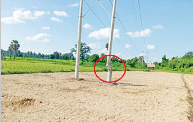
စလင်းမြို့နယ်၌ အကြမ်းဖက်သမားများ မိုင်းထောင်ဖောက်ခွဲ ဖျက်ဆီးခဲ့သည့် ဓာတ်တိုင်။

နေပြည်တော် အောက်တိုဘာ ၂၈ အစွန်းရောက် အကြမ်းဖက်သောင်းကျန်းသူများသည် အေးချမ်းစွာ နေထိုင်သော ပြည်သူလူထုများနှင့် တရားဥပဒေစိုးမိုးရေးအတွက် ဝိုင်းဝန်းဆောင်ရွက်နေသော အုပ်ချုပ်ရေးတာဝန်ရှိသူများအား ထိခိုက် ဒဏ်ရာရရှိစေရန် စာမျက်နှာ ၂၁ ကော်လံ ၁ ❖