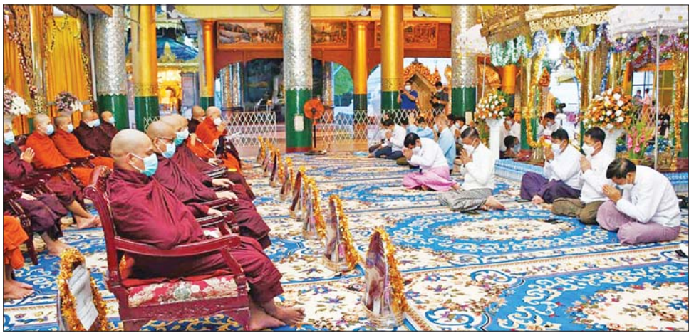
တာဝန်ရှိသူများ၊ ရွှေတိဂုံစေတီတော် ဘဏ္ဍာတော် ဦးစွာ တိုင်းဒေသကြီးဝန်ကြီးချုပ်၊ တိုင်းမှူးနှင့် ထိန်း ဂေါပကအဖွဲ့ဝင်များနှင့် ဧည့်ပရိသတ်များ တက်ရောက်ကြသည်။

နေပြည်တော် အောက်တိုဘာ ၂၅ ရန်ကုန်တိုင်းဒေသကြီး ဒဂုံမြို့နယ်ရှိ လေးဆူဓာတ်ပုံရွှေတိဂုံစေတီတော်မြတ်ကြီး၏ ရင်ပြင်တော်ရှိ ချမ်းသာကြီးတန်ဆောင်း၌ ယနေ့နံနက်ပိုင်းတွင် အသံမစဲ မဟာပဋ္ဌာန်းရွတ်ဖတ်ပူဇော်ပွဲ ဖွင့်ပွဲကို ပြုလုပ်ရာ ဗဟန်းမြို့နယ် ပါဠိတက္ကသိုလ် ညောင်တုန်းကျောင်းတိုက်၏ ပဓာနနာယက၊ နိုင်ငံတော် ဗဟိုသံဃာ့ဝန်ဆောင် တိပိဋကဩဝါဒါစရိယ စေတီ ယင်္ဂဏပဝရ သီရိမဟာမေဋ္ဌရ အဂ္ဂမဟာ ပဏ္ဍိတ အဂ္ဂမဟာဂန္ထဝါစက ပဏ္ဍိတ၊ သ.စ.အ မြောစရိယ (ဝဋ်သကာ)ပါဠိပါရဂူ လှရတနာ ဆရာတော် ဘဒ္ဒန္တ နာရဒါဘိဝံသ အမျိုးပြုသော သံဃာတော်များ ကြွရောက်တော်မူကြပြီး ရန်ကုန်တိုင်းဒေသကြီး ဝန်ကြီးချုပ် ဦးစိုးသိန်း၊ ရန်ကုန်တိုင်းစစ်ဌာနချုပ် တိုင်းမှူး ဗိုလ်ချုပ် ညွှန်ကြားရေးမှူး ဌာနဆိုင်ရာ