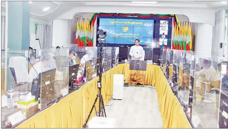
ဌာနဆိုင်ရာများက အေးချမ်းတည်ငြိမ်စွာ ရုံး တင်ပြကြရာ တိုင်းဒေသကြီး ဝန်ကြီးချုပ်က လုပ်ငန်း ပုံမှန်ဆောင်ရွက်နေမှုနှင့် တည်ဆောက် လိုအပ်သည်များ ဖြည့်စွက်မှာကြားခဲ့ကြောင်း သိရ ရေးလုပ်ငန်းဆိုင်ရာ အချက်အလက်များကို ရှင်းလင်း သည်။

အဟုန်မပြတ် ဆက်လက်ဆောင်ရွက်ရန် လိုအပ်ကြောင်း၊ ဒေသထွက်ပစ္စည်းများဖြင့် တန်ဖိုးမြှင့်ပစ္စည်းများ ထုတ်လုပ်နိုင်ရေး ဆောင်ရွက်ရန်၊ မွေးမြူရေးနှင့်ပတ်သက်၍ အသားထုတ်လုပ်မှု တိုးတက်မြှင့်တင်ရေးနှင့် နို့နှင့် နို့ထွက်ပစ္စည်း တန်ဖိုးမြှင့်ထုတ်ကုန်အဖြစ် ထုတ်လုပ်နိုင်ရေး နို့စားနွားမွေးမြူရေး ဖန်တီးရေးအား Pilot Project စတင်ဆောင်ရွက်ရန် လိုအပ်ကြောင်း၊ နို့စားနွား မွေးမြူသူများအတွက် တိရစ္ဆာန် အစာအဆင်ပြေစေရန် နေဗီယာမြက်စိုက်ပျိုးနိုင်ရေး စိုက်ပျိုးမြေများ စီစဉ်ဆောင်ရွက်ပေးသွားရမည်ဖြစ်ကြောင်း၊ အထူးသဖြင့် ဒေသအလိုက် မြေနှင့်ရေကို အကျိုးရှိရှိ အသုံးချရန်လိုအပ်ကြောင်း ပြောကြားသည်။