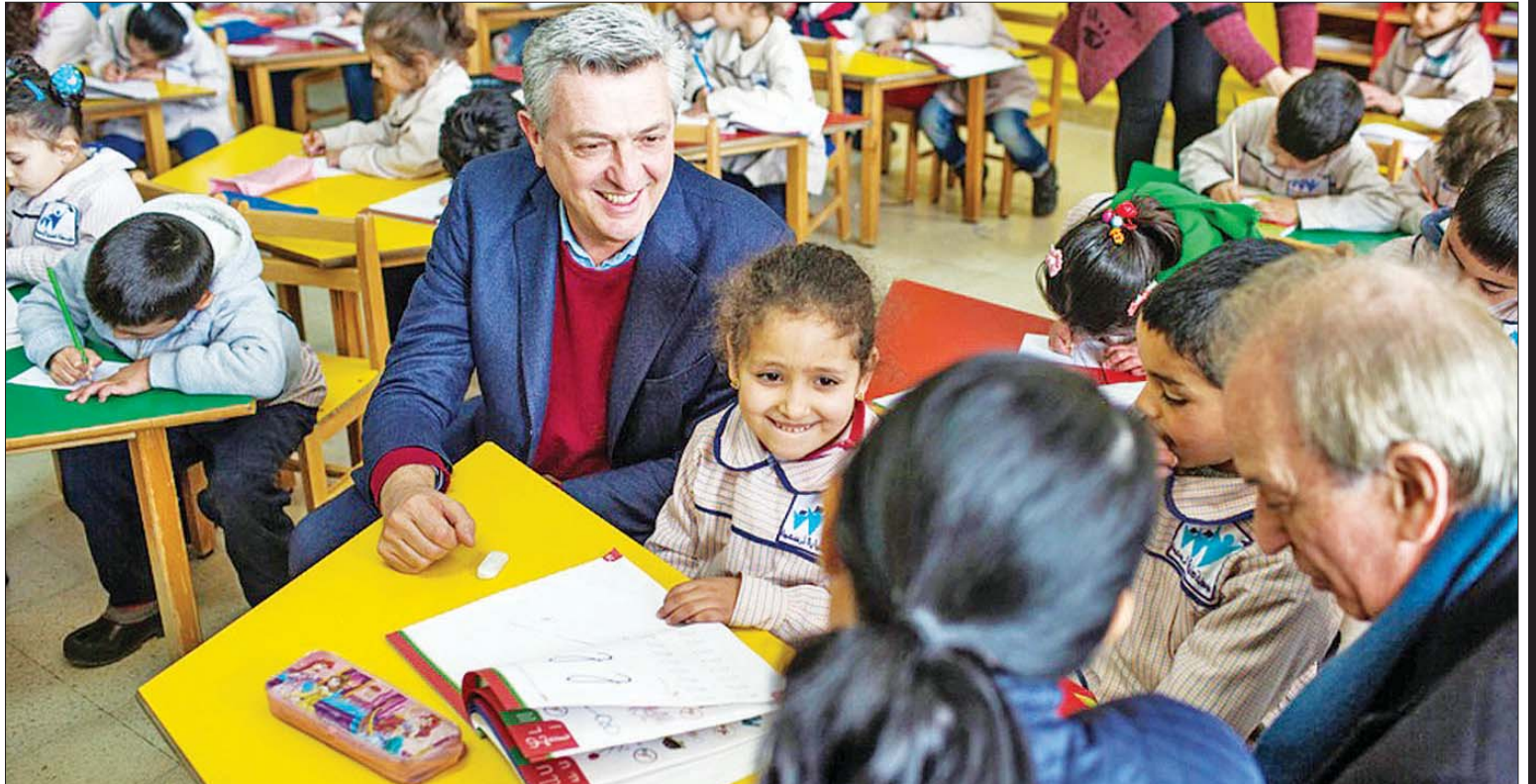
လက်ဘနွန်နိုင်ငံ စာသင်ကျောင်း၌ ပညာသင်ကြားနေသည့် ကျောင်းသား ကျောင်းသူလေးများကို တွေ့ရစဉ်။