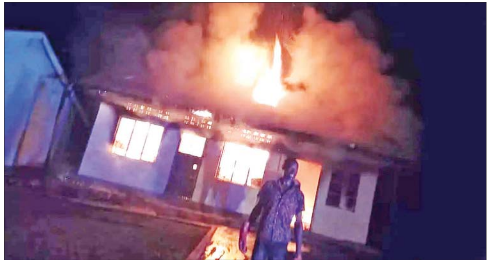
မျက်မမြင် ဆာလာမာကျောင်း မီးလောင်မှုကို တွေ့ရစဉ်။

အဆိုပါ ဝမ်းနည်းဖွယ်ရာ မီးလောင်မှုသည် ဒေသစံတော်ချိန် နံနက် ၁ နာရီ ဝန်းကျင်တွင် မျက်မမြင် ဆာလာမာကျောင်း၌ ဖြစ်ပွားခဲ့ခြင်းဖြစ်ကြောင်း ရဲတပ်ဖွဲ့ သတင်းထုတ်ပြန်ချက်တွင် ဖော်ပြထားသည်။ မီးလောင်ခြင်း၏ အကြောင်းရင်းကို လတ်တလော မသိရှိရသေးကြောင်း၊ လက်ရှိ အချိန်အထိ သေဆုံးသူ ၁၁ ဦးရှိကြောင်းနှင့် ခြောက်ဦးမှာ ပြင်းထန်သော ဒဏ်ရာရရှိခဲ့သောကြောင့် ကီဆိုဂါရှိ ဟီရိုနာ ဆေးရုံသို့