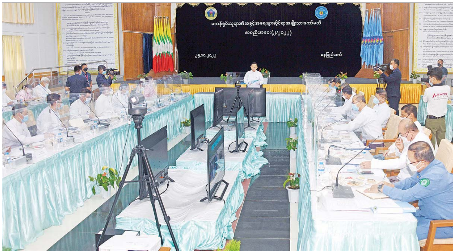
နိုင်ငံတော်စီမံအုပ်ချုပ်ရေးကောင်စီ ဒုတိယဥက္ကဋ္ဌ ဒုတိယဝန်ကြီးချုပ် ဒုတိယဗိုလ်ချုပ်မှူးကြီး စိုးဝင်း မသန်စွမ်းသူများ၏ အခွင့်အရေးများဆိုင်ရာ အမျိုးသားကော်မတီ အစည်းအဝေး (၂/၂၀၂၂)တွင် အမှာစကားပြောကြားစဉ်။

အစည်းအဝေးသို့ ပြည်ထောင်စုဝန်ကြီးများ၊ ဒုတိယဝန်ကြီးများ၊ နေပြည်တော်ကောင်စီဝင်၊ အခွန်အယူခံခုံအဖွဲ့ဥက္ကဋ္ဌ၊ အမြဲတမ်းအတွင်းဝန်များ၊ ညွှန်ကြားရေးမှူးချုပ်များနှင့် တာဝန်ရှိသူများ တက်ရောက်ကြပြီး မြန်မာနိုင်ငံအမျိုးသား လူ့အခွင့်အရေးကော်မရှင် ဒုတိယဥက္ကဋ္ဌ တိုင်းဒေသကြီးနှင့် ပြည်နယ်များမှ မသန်စွမ်းသူများ၏ စာမျက်နှာ ၃ ကော်လံ ၁