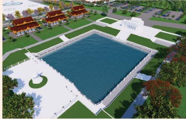
ကျောက်စာရုံစေတီ(၁၂ x ၁၂x ၁၈)ပေ ခု တန်ဖိုး-၂၇၉ သိန်း