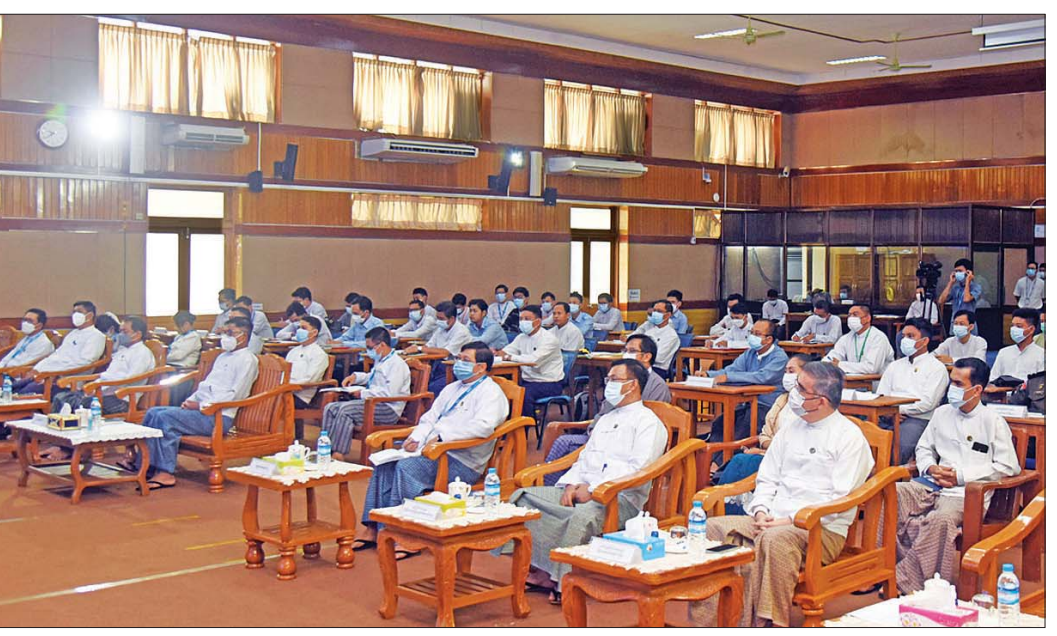
ပြည်ထောင်စုဝန်ကြီး ဦးမောင်မောင်အုန်း မှတ်တမ်းဗီဒီယိုရိုက်ကူးတည်းဖြတ်ခြင်း၊ မှတ်တမ်းဓာတ်ပုံရိုက်ကူးခြင်း၊ သတင်းရေးသားခြင်းဆိုင်ရာ သင်တန်းအမှတ်စဉ် (၂) ဖွင့်ပွဲတွင် အမှာစကားပြောကြားစဉ်။

သင်တန်းဖွင့်ပွဲတွင် ပြည်ထောင်စုဝန်ကြီး ဦးမောင်မောင်အုန်းက အမှာစကားပြောကြားရာ၌ မိမိတို့နိုင်ငံ၌ ပြည်သူအချို့သည် ဖွဲ့စည်းတတ်ပေါ်ရှိသတင်းများ အနက်မှ မည်သည့်က သတင်းတု ဖြစ်သည်၊ သတင်းမှားဖြစ်သည်ကို မဝေခွဲနိုင်တော့ဘဲ ဖြတ်သန်းနေရပါကြောင်း၊ မိမိတို့ဝန်ကြီးဌာနအနေဖြင့် သတင်းမှန်များကို ပြည်သူလူထုထံ ရောက်ရှိအောင် ကိုယ်စွမ်း ဉာဏ်စွမ်းရှိသရွေ့ အလေးထား ဆောင်ရွက်လျက် ရှိပါကြောင်း၊ ပြည်သူများ သတင်းအမှန်သိရှိစေရန် ကြိုးစားဆောင်