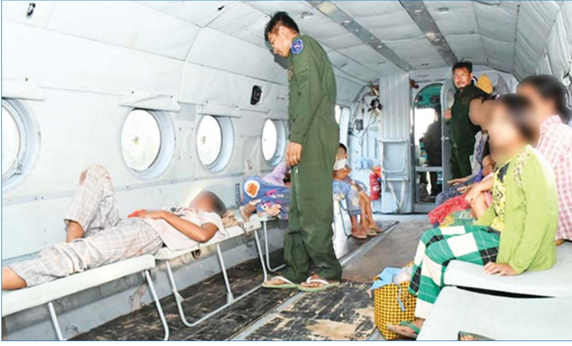
NUG ၊ CRPH တို့၏လက်ဝေခံ PDF အမည်ခံ အကြမ်းဖက်သမားများ၏ မတရားအနိုင်ကျင့်ဖမ်းဆီးချုပ်နှောင်ထားသူများအား လုံခြုံရေးတပ်ဖွဲ့ဝင်များက ကောင်းမွန်စွာ ပြန်လည်ကယ်တင်နိုင်ခဲ့ပြီး ဆေးရုံသို့ ပို့ဆောင်ပေးစဉ်။

နေပြည်တော် အောက်တိုဘာ ၂၅ NUG ၊ CRPH တို့၏ လက်ဝေခံ PDF အမည်ခံ အကြမ်းဖက်သမားများက စစ်ကိုင်းတိုင်းဒေသကြီးအတွင်း မြို့ရွာများမှ မတရားအနိုင်ကျင့်ဖမ်းဆီးချုပ်နှောင်ထားသော အမျိုးသမီးနှင့် ကလေးငယ်များအပါအဝင် နိုင်ငံဝန်ထမ်းများ၊ ကျေးရွာသူ၊ ကျေးရွာသား ၂၆ ဦးအား ယနေ့နံနက်ပိုင်းတွင် လုံခြုံရေးတပ်ဖွဲ့ဝင်များက ပုလဲမြို့နယ် ဖလံပင်ကျေးရွာ မြောက်ယမားဆည်အနီးရှိ PDF အမည်ခံ အကြမ်းဖက်သမားများ၏ စခန်းအတွင်းမှ ကောင်းမွန်စွာ ပြန်လည်ကယ်တင်နိုင်ခဲ့ကြောင်း သိရှိရသည်။ ဖြစ်စဉ်မှာ ဂန့်ဂေါမြို့နယ်အနီး နယ်မြေခံတပ်ရင်းမှ အရာရှိဇနီးတစ်ဦးသည် အောက်တိုဘာ ၁၅ ရက်တွင် မုံရွာမှ ကျောမြို့သို့ လိုက်ပါလာစဉ် ကန်ဒေါင့်ကျေးရွာအနီးတွင် PDF အမည်ခံ စာမျက်နှာ ၂၁ ကော်လံ ၁