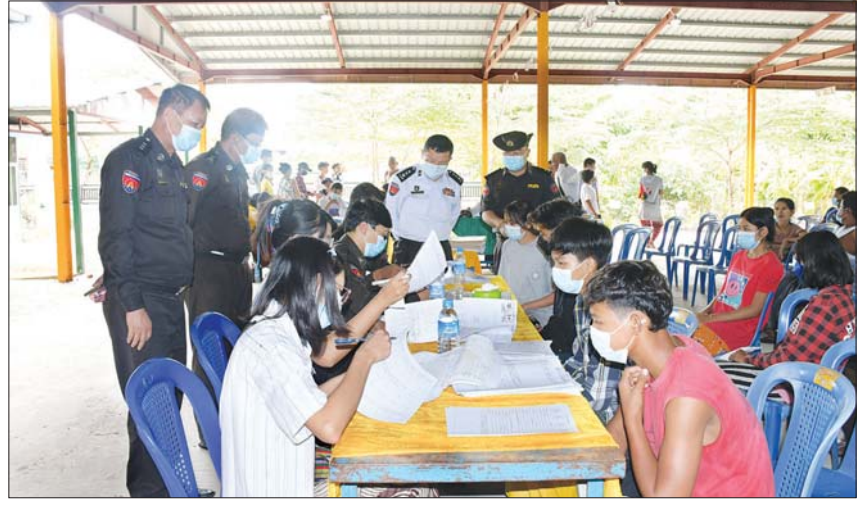
မျိုးသီဟ(ပြန်/ဆက်)

၂၀၂၂ ခုနှစ် ဩဂုတ် ၁ ရက်မှ ၂၀၂၃ ခုနှစ် ဇန်နဝါရီ ၃၁ ရက်အထိ အသက် ၁၀ နှစ်ပြည့်ပြီး သူများနှင့် အသက် ၁၈ နှစ် ပြည့်ပြီးသူများအား နိုင်ငံသားစိစစ်ရေးကတ်ပြားများကို ဥပဒေနှင့် အညီ ထုတ်ပေးလျက်ရှိကြောင်း၊ စီမံချက် ကာလအတွင်း နိုင်ငံသားအခွင့်အရေးများ ဆုံးရှုံးမှုမရှိစေရေး နိုင်ငံသားတိုင်းရယူပိုင်ဆိုင် သင့်သည့် နိုင်ငံသားစိစစ်ရေးကတ်များ ဆောင်ရွက်ပေးနေမှု အခြေအနေတို့နှင့် ပတ်သက်၍ ရှင်းလင်းပြောကြားခဲ့သည်။ ထို့နောက် ကင်ပွန်းတန်းအုပ်စုအတွင်းရှိ ပြည်သူများအား နိုင်ငံသားစိစစ်ရေးကတ်ပြား များ ပြုလုပ်ပေးရာတွင် ကိုယ်ရေးအချက် အလက်များ ပြည့်သွင်းမှုမှန်ကန်စေရေး အတွက် သက်ဆိုင်ရာတာဝန်ရှိသူများက လိုအပ်သည်တို့ကို ဖြည့်စွက်ကူညီဆောင်ရွက် ပေးခဲ့ကြပြီး ကင်ပွန်းတန်းအုပ်စုအတွင်းရှိ အမျိုးသား ၅၂ ဦး၊ အမျိုးသမီး ၅၀ စုစုပေါင်း ၁၀၂ ဦးတို့အား နိုင်ငံသားစိစစ်ရေးကတ်များ အခမဲ့ ကွင်းဆင်းဆောင်ရွက်ပေးခဲ့ကြောင်း သိရသည်။