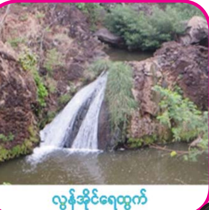
လွန်အိုင်ရေထွက်

ပြုတ်တု ဓာတ်ပုံမှတ်တမ်းတင်ချက် အရ ဥယျာဉ်၏ ဧရိယာ ၉၄ ဒသမ ၅၆ ရာခိုင်နှုန်းကို သစ်တောများ လွှမ်းခြုံထားကြောင်း သိမှတ်ရပြီး ရွက်အုပ်ပိတ်တောနှင့် ရွက်အုပ် ပွင့်တော ဧကအများဆုံး ဖုံးလွှမ်း ထားခြင်းဖြင့် “ပုပ္ဖားတောင် ဥယျာဉ်” သည် သာမောဗွယ်ရာ စိမ်းလန်းစိုပြည်သော “အိုအေစစ်” ကလေးသဖွယ် တည်ရှိ နေပါသည်။