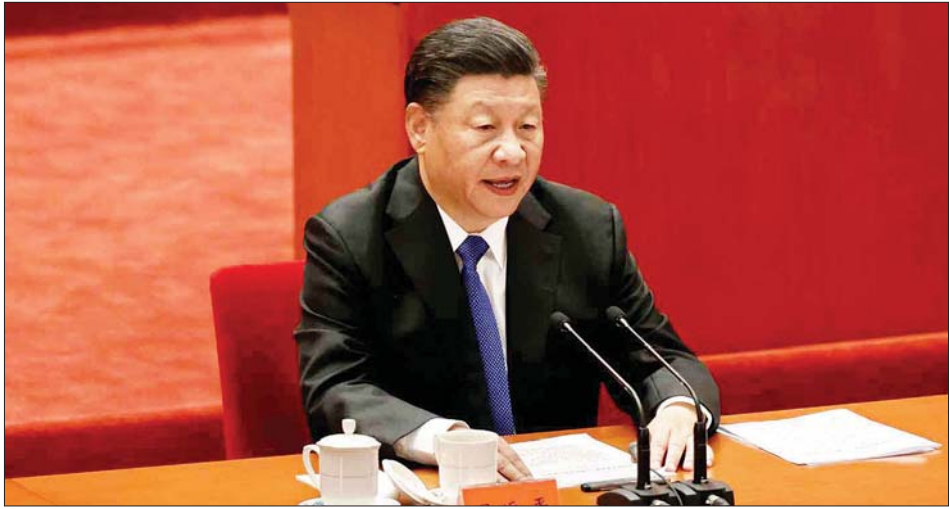
တရုတ်သမ္မတ ရီကျင့်ဖျင်။

ရာထူးဖယ်ရှားခြင်း ခံခဲ့ရသည်။ ဒုတိယဝန်ကြီးချုပ် ဟူချန်ဟွာသည် တရုတ်နိုင်ငံ၏ အနာဂတ် ခေါင်းဆောင်အဖြစ် သတ်မှတ်ခြင်းခံခဲ့ရသည်။ သို့သော်လည်း ပေါလစ်ဗျူရှိအဖွဲ့ဝင်အဖြစ် ရာထူး ဆုံးရှုံးခဲ့သည်။ ပေကျင်းလမ်းများပေါ်တွင် ပြည်သူများက သမ္မတရီကျင့်ဖျင်နှင့် ၎င်း၏အစိုးရအဖွဲ့ဝင်သစ်များ အပေါ် မျှော်လင့်ချက်မြင့်မြင့်ထားကြောင်း ဖော်ပြ ခဲ့ကြသည်။ ရီ၏အစိုးရအဖွဲ့ဝင်သစ်များသည် ကိုဗစ်-၁၉ ကပ်ရောဂါမှ ပြန်လည်ရှင်သန် နိုးထရေးအတွက် စိန်ခေါ်မှုသစ်များကို ရင်ဆိုင်ရမည်ဖြစ်သည်။ ထို့အပြင် တရုတ်နိုင်ငံတွင် သက်ကြီးလူဦးရေ တိုးပွားများပြားပြီး မွေးဖွားမှုနှုန်း နည်းပါးမှုနှင့် လည်း ရင်ဆိုင်နေရသည်။ အင်န်အိတ်ချ်ကေ၊ ဆင်ဟွာ