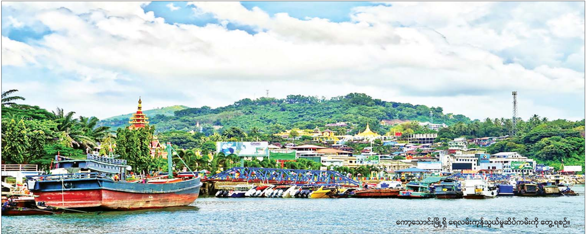
ကော့သောင်းမြို့ရှိ ရေလမ်းကုန်သွယ်မှုဆိပ်ကမ်းကို တွေ့ရစဉ်။