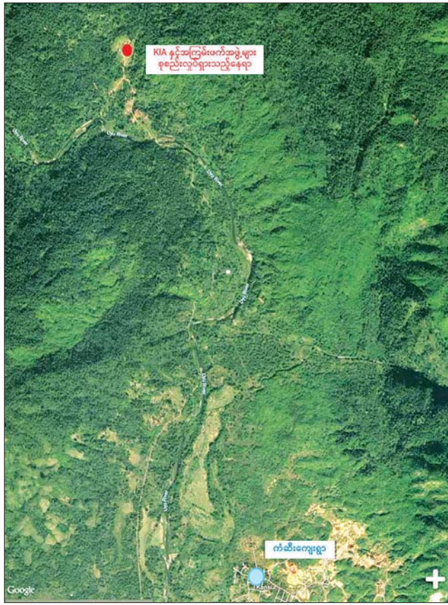
ဖားကန့်နယ်မြေအတွင်း လုံခြုံရေးတပ်ဖွဲ့ဝင်များက လုံခြုံရေးဆိုင်ရာ လုပ်ငန်းများ ဆောင်ရွက်ခဲ့သည့် ဖြစ်စဉ်နေရာပြပုံ။

နေပြည်တော် အောက်တိုဘာ ၂၄ သတင်းတူ သတင်းမှားနှင့် သတင်းလိမ်များဖော်ပြ၍ ကောလာဟလ ဖြန့်ဝေနေကြသော Online Media များက ဖားကန့်တေးဂီတ ဖျော်ဖြေ ပွဲအား တပ်မတော်လေယာဉ်ဖြင့် ဗုံးကြဲမှုကြောင့် အပြစ်မဲ့ ပြည်သူများနှင့် ကချင်ဝါရင့်အဆိုရှင်အချို့ သေဆုံးခဲ့ကြောင်း လူမှုကွန်ရက်တွင် ကောလာဟလသတင်းများ ဖြန့်ဝေလျက်ရှိကြောင်း တွေ့ရှိရသည်။