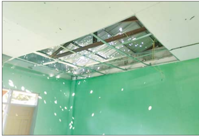
ကော့ကရိတ်မြို့နယ်ရှိ Drone ဖြင့် ဖုံးခွဲတိုက်ခိုက်မှုကြောင့် ဒဏ်ရာရရှိ သူနှင့် အထက်(ချောင်းတောင်)အား Drone ဖြင့် ဖုံးခွဲဖျက်ဆီးမှုကြောင့် ပျက်စီးမှုကို တွေ့ရစဉ်။

ဆေးရုံသို့ ပို့ဆောင်ဆေးကုသမှု ခံယူစေလျက်ရှိသည်။ ယခုကဲ့သို့ စစ်ရေးနှင့်မသက်ဆိုင်သော စာသင်ကျောင်းများ၊ ဆရာ ဆရာမများ နှင့် ကျောင်းသား ကျောင်းသူများအား ပညာသင်ကြား သည့်နေရာများကို ရည်ရွယ်ချက်ရှိစွာဖြင့် အကြမ်းဖက်တိုက်ခိုက်ခြင်း သည် ဂျီနီဗာကွန်ဗန်ရှင်းများနှင့် အပြည်ပြည်ဆိုင်ရာ ဥပဒေတို့အရ စစ်ရာဇဝတ်မှု (War Crime) ကို ကျူးလွန်ခြင်းဖြစ်သည်။ ထိုကဲ့သို့