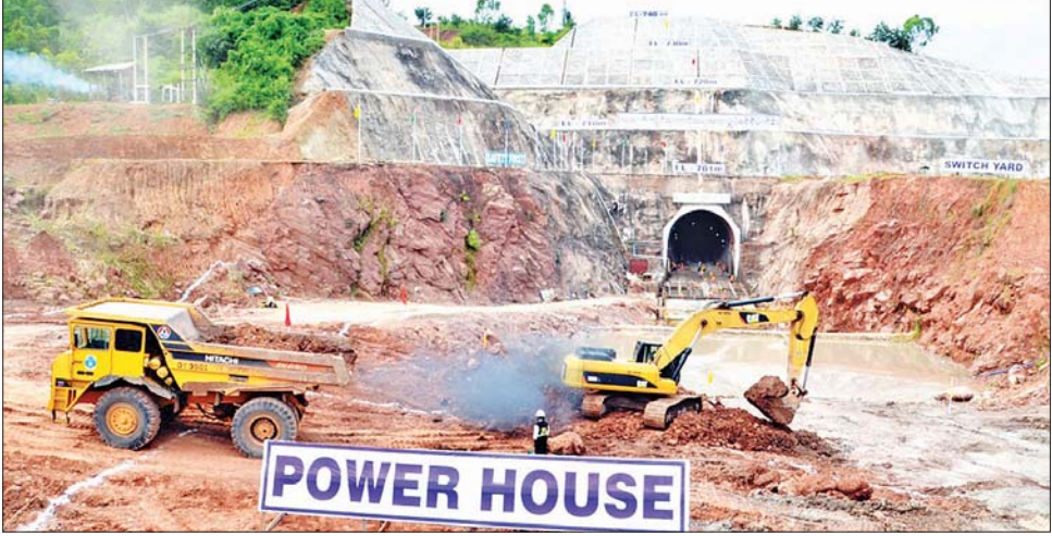
အထက်ကျိုင်းတောင်း ရေအားလျှပ်စစ်စီမံကိန်းလုပ်ငန်းခွင်