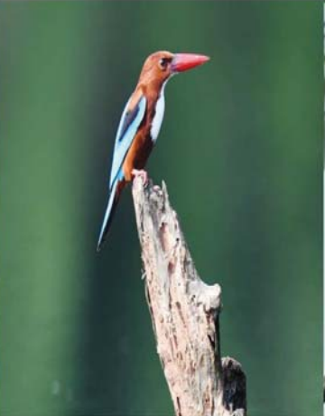
ဝိန်ညှင်းရင်ဖြူ (White-throated Kingfisher)