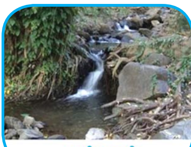
ဝေစမ်းရေထွက်

မန္တလေးတိုင်းဒေသကြီး ညောင်ဦး ခရိုင် ကျောက်ပန်းတောင်မြို့၏ အရှေ့ မြောက်ဘက် ၁၀ မိုင်ခန့် အကွာ၌ သစ်တောဦးစီးဌာနက “ပုပ္ဖားတောင် ဥယျာဉ်” ကို ၁၉၈၂ ခုနှစ် မေလအတွင်း စတင် တည်ထောင်ခဲ့ပါ၏။ ယင်းမှာ ကြက်မောက်တောင် ကြိုးဝိုင်းသစ်တော တစ်ခွင်လုံးကို လွှမ်းခြုံကာ “ပုပ္ဖားတောင် ဥယျာဉ်” အဖြစ် ၁၉၈၉ ခုနှစ် ဩဂုတ် ၂၄ ရက်က သတ်မှတ်ကြေညာခဲ့ပြီး ၁၉၉၃ ခုနှစ် နိုဝင်ဘာ ၇ ရက်မှစတင် ကာ အများပြည်သူများ ဝင်ရောက်စေ့ငု လေ့လာနိုင်ရေးအတွက် ဥယျာဉ်ကိုစတင် ဖွင့်လှစ်ပေးခြင်းဖြစ်ပေသည်။