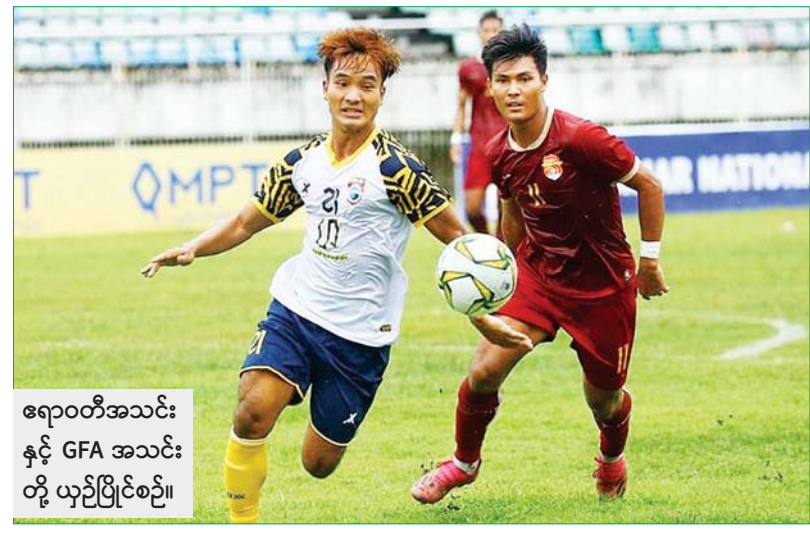
ဧရာဝတီအသင်း နှင့် GFA အသင်း တို့ ယှဉ်ပြိုင်စဉ်။