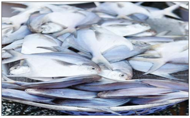
အပါအဝင် ပြည်ပဈေးကွက်များ ၂၀၂၁-၂၀၂၂ ဘဏ္ဍာနှစ် (Mini Budget) ခြောက်လတာကာလ သို့လည်း ထိုးဖောက်ရောင်းချနိုင်ခဲ့ ဖြစ်သည်။

မောင်တော ကုန်သွယ်ရေး စခန်းမှ ဘင်္ဂလားဒေ့ရှ်ဈေးကွက် သို့ တင်ပို့နေသော ရေထွက် ပစ္စည်း ပို့ကုန်အမယ်များထဲတွင် ငါးမြစ်ချင်းအပြင် ငါးမုတ်သည် လည်း ရေထွက်ပစ္စည်းအမယ် တစ်ခုအဖြစ် ပါဝင်လျက်ရှိ သည်။ မြန်မာနိုင်ငံတွင် စိုက်ပျိုး ရေးနှင့် မွေးမြူရေး လုပ်ငန်း များကို ဒေသအလိုက် အဓိက စီးပွားရေးလုပ်ငန်း အဖြစ် လုပ်ကိုင်လျက်ရှိကြရာ ငါးမုတ် များကို ဘင်္ဂလားဒေ့ရှ်ဈေးကွက်