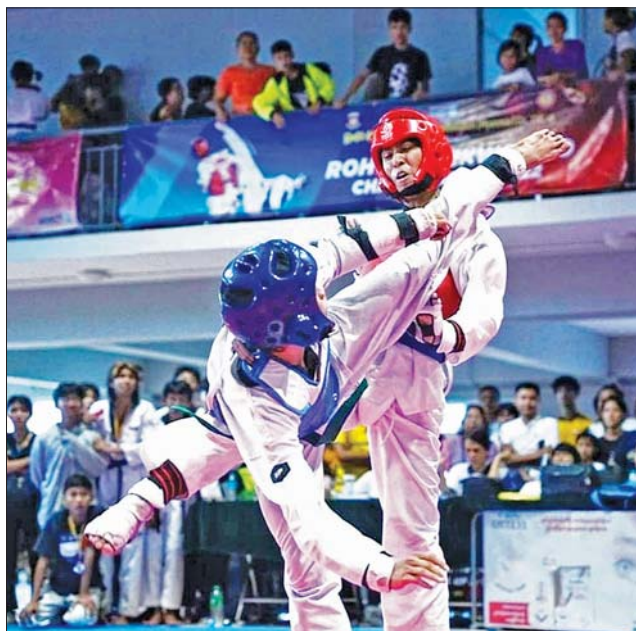
တိုက်ကွမ်ဒို အမျိုးသားခါးစည်းအနက်ယှဉ်ပြိုင်မှုကို တွေ့ရစဉ်။