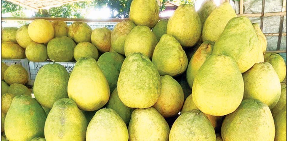
သီး(ခေါ်) မြောင်းဘွေကျွဲကောသီး လူကြိုက်များပြီး ရောင်းချရာတွင် ဟူ၍ သုံးမျိုးရှိသည်။ ထိုသုံးမျိုးထဲတွင် ရှမ်းကျွဲကောသီး(ခေါ်) မြောင်းဘွေ ကျွဲကောသီးမှာ အချို့ရှေး၍ အရည်လည်းရွှမ်းသဖြင့် မှာ တစ်လုံးလျှင် ငွေကျပ် ၅၀၀၀ မှ ၆၀၀၀ နှုန်းအထိ ဈေးကောင်းရရှိကြောင်း ကျွဲကောစိုက်ပျိုးသူ ယာရှင် ဦးမောင်သိန်းလှထံမှ သိရသည်။ စိုးငြိမ်းနိုင် (ပြန်ဆက်)

မြောက်ဦး အောက်တိုဘာ ၂၄ ရခိုင်ပြည်နယ် မြောက်ဦးမြို့နယ် အတွင်းရှိ မြောင်းဘွေကျွဲနှင့် လေးမြို့ မြစ်အထက်ဘက်ရှိ ကျေးရွာများဖြစ်သော ဆင်အိုးကျေးရွာ၊ လေညှင်းတောင်ကျေးရွာ၊ ပိုးဖြူကျွန်းနှင့် ပန်းမြောင်းစသော ကျေးရွာများတွင် ဥယျာဉ်ခြံမြေလုပ်ကိုင်သူ ယာရှင်များအနေဖြင့် ကျွဲကောသီးများကို စီးပွားဖြစ် အဓိက စိုက်ပျိုးလျက်ရှိပြီး ကျွဲကောသီးများကို ခူးယူရောင်းချ လျက်ရှိကြောင်း သိရသည်။ ကျွဲကောသီးများကို စိုက်ပျိုးထွက်ရှိရာနေရာ ဒေသများတွင် သာမက ရခိုင်ပြည်နယ်အတွင်းရှိ စစ်တွေမြို့၊ ကျောက်တော်မြို့၊ မင်းပြားမြို့၊ သံတွဲမြို့၊ ကျောက်ဖြူမြို့စသော မြို့များသို့လည်း ပို့ဆောင်၍ ရောင်းချလျက်ရှိကြောင်းနှင့် ရန်ကုန်၊ မန္တလေးမြို့ကြီးများသို့လည်း ပို့ဆောင်ရောင်းချလျက်ရှိကြောင်း သိရသည်။ မြောင်းဘွေကျွဲကောသီးကို ရခိုင်ပြည်နယ်အတွင်းရှိ မြို့များတွင်နေထိုင်ကြသော ပြည်သူများအနေဖြင့် ဒေသထွက် ရာသီပေါ်သီးနှံအဖြစ် ဒေသလက်ဆောင်ပေးခြင်းပြုကြသဖြင့် ယခုနှစ်တွင် မြောင်းဘွေကျွဲရရှိ ယာရှင်များမှာ ယခင်နှစ်များထက် ဈေးကောင်းရပြီး ဝင်ငွေတိုးတက်လျက်ရှိကြောင်း သိရသည်။ ကျွဲကောသီးများတွင် သပိတ်သီး(ခေါ်) အနီသီး၊ တရုတ်သီး(ခေါ်) အဖြူသီးနှင့် ရှမ်းကျွဲကော