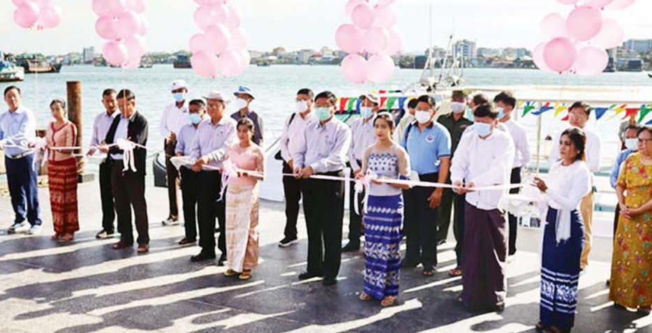
စောင့်ရှောက်နိုင်ရန် မြန်မာ့ ကမ်းရိုးတန်းတစ်လျှောက်ရှိ ငါးသယ်ဇာတ ထိန်းသိမ်းရေး လုပ်ငန်းများကို ဒေသခံပြည်သူများနှင့်ပူးပေါင်း၍ မိတ်ဖက်နိုင်

နေပြည်တော် အောက်တိုဘာ ၂၄ ဒိန်းမတ်-မြန်မာ စီမံကိန်းမှ ကမ်းနီးငါးလုပ်ငန်း စစ်ဆေးရေးရေယာဉ်နှစ်စင်း လွှဲအပ်ခြင်း အခမ်းအနားကို ယမန်နေ့နံနက်ပိုင်းက မြိတ်မြို့ ပြည့်ဖြိုးထွန်း အင်တာနေရှင်နယ် ကုမ္ပဏီလီမိတက် ငါးချဆိပ်ကမ်းတွင် ကျင်းပသည်။ အခမ်းအနားတွင် စိုက်ပျိုးရေး၊ မွေးမြူရေးနှင့် ဆည်မြောင်းဝန်ကြီးဌာန ဒုတိယဝန်ကြီး ဒေါက်တာအောင်ကြီးက ဝန်ကြီးဌာနအနေဖြင့် စိုက်ပျိုးရေး၊ မွေးမြူရေးလုပ်ငန်းများ ဖွံ့ဖြိုးတိုးတက်ရေးနှင့်အတူ ငါးကဏ္ဍ ဖွံ့ဖြိုးတိုးတက်ရေးကို အလေးထားဆောင်ရွက်လျက် ရှိကြောင်း၊ အထွေထွေအရ ထိန်းသိမ်းစောင့်ရှောက်နိုင်ရန် မြန်မာ့ ကမ်းရိုးတန်းတစ်လျှောက်ရှိ ငါးသယ်ဇာတ ထိန်းသိမ်းရေး လုပ်ငန်းများကို ဒေသခံပြည်သူများနှင့်ပူးပေါင်း၍ မိတ်ဖက်နိုင်