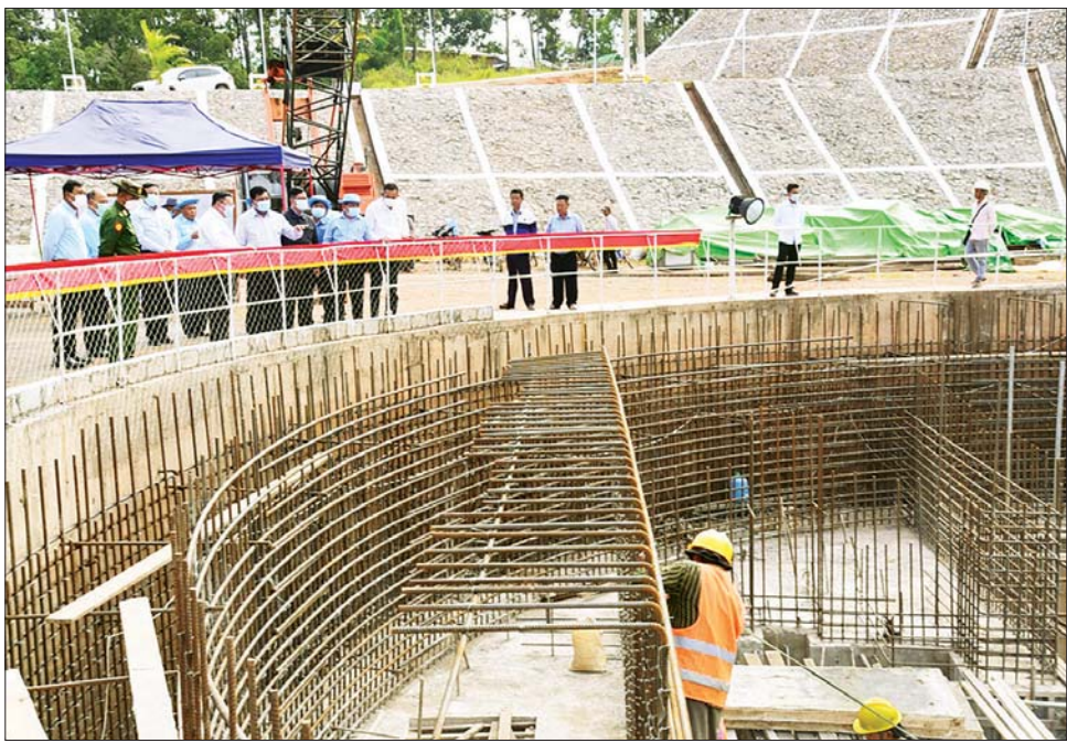
ပြည်ထောင်စုဝန်ကြီး ဦးသောင်းဟန်နှင့် တာဝန်ရှိသူများ အထက်ကျိုင်းတောင်း ရေအားလျှပ်စစ်စီမံကိန်း လုပ်ငန်းခွင်၌ စီမံကိန်းလုပ်ငန်းများ ဆောင်ရွက်နေမှုကို ကြည့်ရှုစစ်ဆေးစဉ်။

နေပြည်တော် အောက်တိုဘာ ၂၄ ရှမ်းပြည်နယ်တောင်ပိုင်း ကျိုင်းတောင်းမြို့၏ အနောက်တောင်ဘက် ၁၄ မိုင်ခန့်အကွာ နမ့်တိန် ချောင်းပေါ်တွင် ရေအားလျှပ်စစ်အကောင်အထည် ဖော်ရေးဦးစီးဌာန အမှတ် (၅) တည်ဆောက်ရေးက အကောင်အထည်ဖော် ဆောင်ရွက်လျက်ရှိသည့် အထက်ကျိုင်းတောင်း ရေအားလျှပ်စစ်စီမံကိန်း၏ ပင်မရေလှောင်တံခံမှာ အလျားပေ ၁၈၀၀၊ အမြင့် ပေ ၂၃၀ ရှိ ဇန်အမျိုးအစားကျောက်ဖြည့်တံခံ ဖြစ် သည်။ ကန်ရေပြည့် ရေသိုလှောင်ပမာဏမှာ ဧက ပေ ၁၀၄၀၀၀ ရှိကာ စက်တပ်ဆင်အင်အား ၁၇ မဂ္ဂါဝပ်ရှိ စက်သုံးလုံးဖြင့် စုစုပေါင်းစက်တပ်ဆင် အင်အား ၅၁ မဂ္ဂါဝပ်မှ နှစ်စဉ်ပျမ်းမျှ လျှပ်စစ် ဓာတ်အားကီလိုဝပ် နာရီသန်းပေါင်း ၂၆၇ သန်း ထုတ်လုပ်ပေးနိုင်မည့် ဒေသအကျိုးပြု စီမံကိန်း တစ်ခုဖြစ်သည်။ ယခုအခါ စီမံကိန်းတစ်ခုလုံး၏ ၇၂ ဒသမ ၂၀ ရာခိုင်နှုန်းခန့် ပြီးစီးနေပြီဖြစ်ပြီး ၂၀၂၂-၂၀၂၃ ဘဏ္ဍာရေးနှစ်ကုန်ဆုံးပါက ၇၆ ဒသမ ၅၇ ရာခိုင်နှုန်းခန့် ပြီးစီးမည်ဖြစ်ကာ စီမံကိန်းတစ်ခုလုံး အနေဖြင့် ၂၀၂၅ ခုနှစ် မတ်လတွင် ပြီးစီးမည်ဖြစ်သည်။