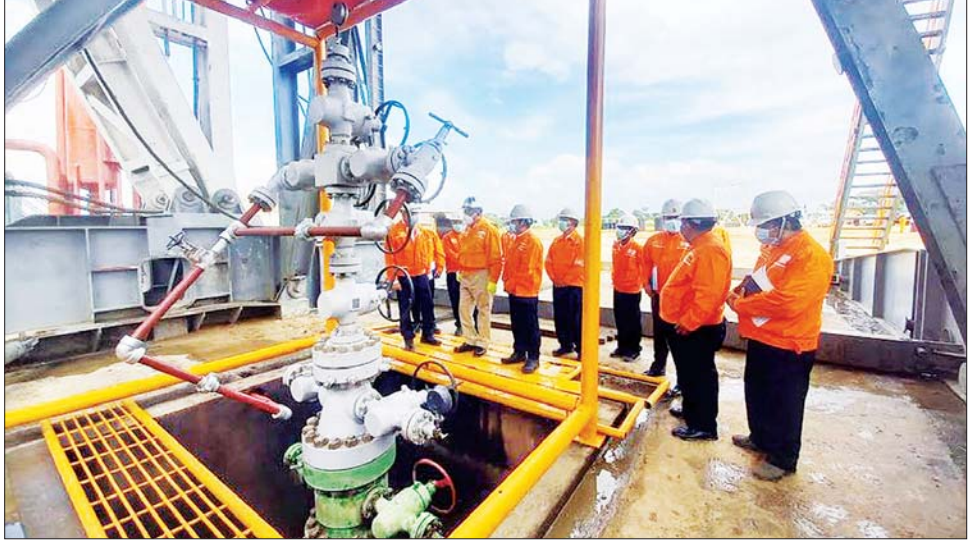
ထိုနေ့က ပြည်ထောင်စုဝန်ကြီးသည် တွင်းအမှတ် CDT-15 ကို အောင်မြင်အောင်တူးဖော်ရာ၌ ကိုယ်စွမ်းဉာဏ်စွမ်းရှိသူမျှ ကြိုးစားဆောင်ရွက်ပေးခဲ့ကြသော ကာယ၊ ဉာဏ လုပ်သားကြီးများအား အမှတ်တရသစ်သီးခြင်းနှင့် ဂုဏ်ပြုဆုငွေများ ပေးအပ်သည်။ အဆိုပါ တွင်းအမှတ် CDT-15 ကို ဇွန် ၃၀ ရက်က စတင်တူးဖော်ခဲ့ရာ ရည်မှန်း အနက်ပေ ၇၉၂၀ သို့ စက်တင်ဘာ ၁၉ ရက်တွင်ရောက်ရှိခဲ့ပြီး တစ်ရက်လျှင် ရေနံစိမ်းရှစ်စည်ခန့်နှင့် သဘာဝဓာတ်ငွေ့ ၀ ဒသမ ၅ သန်းခန့် ထုတ်လုပ်လျက်ရှိရာ ထုတ်လုပ်ရရှိသော သဘာဝဓာတ်ငွေ့များကို ချောက်-ဆားခါး-ပုလိပ်-ကျောက်ဆည် ပိုက်လိုင်းအတွင်းသို့ အားဖြည့်ပို့လွှတ်သွားမည်ဖြစ်သည်။ သတင်းစဉ်

ဒေသ ZJ 70 L SR 1 တွင်းတူးစက်ဖြင့် အောင်မြင်စွာ တူးဖော်ခဲ့ပြီး ရေနံနှင့် သဘာဝဓာတ်ငွေ့များ ထုတ်လုပ်လျက်ရှိသော တွင်းအမှတ် CDT-15 ကို ကြည့်ရှုစစ်ဆေးကာ (ယာပုံ) ချောက်ရေနံမြေတွင် ဆက်လက် တူးဖော်သွားမည့် ထုတ်လုပ်ရေးတွင်းများ အလား အလာများကို ဆွေးနွေးသည်။ ဆက်လက်၍ ပြည်ထောင်စုဝန်ကြီးက နောင် တူးဖော်မည့် တွင်းများကိုလည်း ယခုကဲ့သို့ မြေအောက် အခက်အခဲများကို အောင်မြင်အောင် ကြိုးစားဆောင်ရွက်သွားကြစေလိုကြောင်း၊ ထုတ်လုပ်ရရှိသောရေနံနှင့် သဘာဝဓာတ်ငွေ့များကို အကျိုးရှိထိရောက်စွာ အသုံးပြုနိုင်ရေး စနစ်တကျ စီမံဆောင်ရွက်ကြရန် လိုကြောင်း မှာကြားပြီး တွင်းအမှတ် CDT-15 မှ ထွက်ရှိသော သဘာဝဓာတ်ငွေ့များ စီးပို့စမ်းသပ်နေမှုကို ကြည့်ရှုစစ်ဆေးသည်။