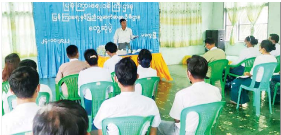
ဒုတိယဝန်ကြီး ဦးရဲတင့် မကွေးတိုင်းဒေသကြီးအတွင်းမှ ပြန်ကြားရေးဝန်ကြီးဌာန လက်အောက်ရှိ ဝန်ထမ်းများနှင့် တွေ့ဆုံအမှာစကားပြောကြားစဉ်။

နေပြည်တော် အောက်တိုဘာ ၂၄ ပြန်ကြားရေးဝန်ကြီးဌာန ဒုတိယဝန်ကြီး ဦးရဲတင့်သည် ယနေ့ နံနက်ပိုင်းတွင် ချောက်မြို့နယ် ပြန်ကြားရေးနှင့် ပြည်သူ့ဆက်ဆံရေးဦးစီးဌာနရုံး၊ ရေနံချောင်းမြို့နယ် ပြန်ကြားရေးနှင့်ပြည်သူ့ဆက်ဆံရေး ဦးစီးဌာနရုံးနှင့် စာကြည့်တိုက်တို့ကို ကြည့်ရှုစစ်ဆေးပြီး ဝန်ထမ်းများနှင့် တွေ့ဆုံသည်။