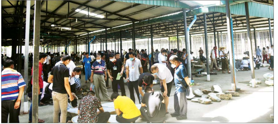
မြန်မာ့ကျောက်မျက်ရတနာပြုပွဲ၌ ခင်းကျင်းပြသထားသည့် ကျောက်စိမ်းအတွဲများအား ပြည်တွင်း၊ ပြည်ပ ရတနာကုန်သည်များ စိတ်ကြိုက်ကြည့်ရှုလေ့လာကြစဉ်။

ကျော့မှုးမှ ကျောက်စိမ်းအရိုင်းတွဲများကို စိတ်ကြိုက်လေ့လာကြည့်ရှုကြသည်။ ယနေ့ပြပွဲတွင် ရောင်းချမည့် ကျောက်စိမ်းအတွဲအမှတ် ၇၅၁ မှ အတွဲအမှတ် ၁၅၀၀ အထိ ကျောက်စိမ်းအတွဲများကို ရတနာကုန်သည်များက ကြည့်ရှုစစ်ဆေးကြပြီး ဈေးနှုန်းတင်သွင်းလွှာများကို တင်ဒါပေးအတွင်းသို့ ထည့်သွင်းကြသည်။