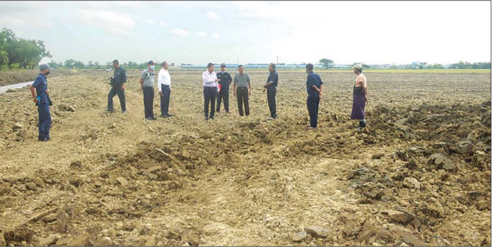
ရန်ကုန်မြို့တော်ဝန် ဦးဗိုလ်ဌေး ဆောင်းသီးနံ့နေကြာစိုက်ပျိုးရန် မြေပြုပြင်နေမှုကို ကြည့်ရှုစစ်ဆေးစဉ်။

ထိုသို့ ပြောကြားခဲ့ခြင်းဖြစ်ပြီး တောင်းရမ်း စားသောက်သူကလေးသူငယ်များ မရှိစေရေး စည်းကမ်းထိန်းသိမ်းဆောင်ရွက်ရန်နှင့် ယာဉ်အန္တရာယ်၊ လမ်းအန္တရာယ်ကင်းရှင်းရေး ပညာပေးအစီအစဉ်များ တိုးမြှင့်ဆောင်ရွက်ကြရန် တာဝန်ရှိသူများကို မှာကြားခဲ့သည်။