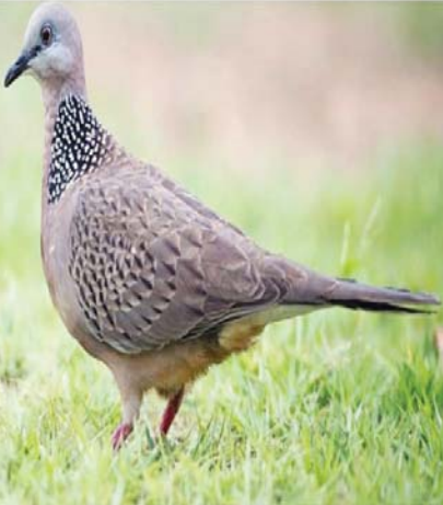
ချိုးလည်ပျောက် (Spotted Dove)

အထူးသဖြင့် စေတီပုထိုး၊ နတ်ကွန်း နတ်နန်းများဖြင့် ရိုးရာဓလေ့များ ထုံမွမ်းရာ ဒေသဖြစ်သည့်အညီ ဒေသခံပြည်သူများ အကြား ဇီဝမျိုးစုံမျိုးကွဲများ ထိန်းသိမ်းရေး အသိပညာများကို ဟန်ချက်ညီညီ ထိန်းသိမ်း စောင့်ရှောက်နိုင်ရေးအတွက်ပါ စနစ်တကျ စီမံချက် ချမှတ်ဖော်ဆောင်လျက်ရှိပါ၏။ သဘာဝ စိမ့်စမ်းရေထွက်များ တည်ရှိရာဒေသ ဖြစ်ပေရာ ဒေသခံကျေးရွာပြည်သူများ ရာသီမရွေး သောက်သုံးရေအတွက် ရတက်မအေး မဖြစ်ကြရန်အတွက်လည်း ဤဥယျာဉ်က ထောက်ပံ့ဖြည့်ဆည်းပေးလျက်ရှိ