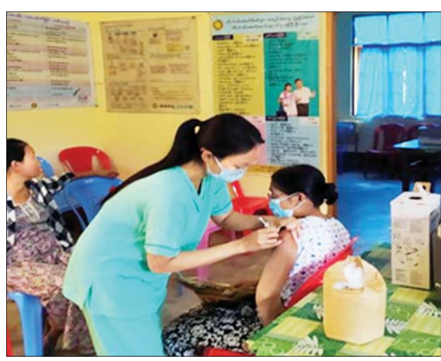
ဧရာဝတီတိုင်းဒေသကြီးအတွင်းရှိ ပြည်သူများအား ကိုဗစ်-၁၉ ရောဂါ ကာကွယ်ဆေးထိုးနှံပေးစဉ်။

နေပြည်တော် အောက်တိုဘာ ၂၄ တိုင်းဒေသကြီးနှင့် ပြည်နယ် အသီးသီးတို့၌ ကာကွယ်ဆေး ထိုးနှံခြင်း ဆောင်ရွက်လျက်ရှိရာ ယနေ့တွင် ဧရာဝတီတိုင်းဒေသ ကြီးအတွင်းရှိ မြို့နယ် ၂၆ မြို့နယ် ၌ ဒေသခံပြည်သူ ၇၅၅ ဦး၊ ရခိုင်ပြည်နယ်အတွင်းရှိ မြို့နယ် သုံးမြို့နယ်၌ ဒေသခံပြည်သူ ၅၁၈ ဦး၊ မန္တလေးတိုင်းဒေသကြီး ကျောက်ဆည်ခရိုင်နှင့် ရမည်း သင်းခရိုင်တို့မှ ဒေသခံပြည်သူ ၁၅၅ ဦးတို့ကို တပ်မတော်မှ ဆေး အဖွဲ့များက ပြည်သူ့ဆေးရုံများမှ ဆရာဝန်များ၊ သက်ဆိုင်ရာ ကျန်းမာရေး ဝန်ထမ်းများ၊ စေတနာ့ ဝန်ထမ်းများနှင့် ပူးပေါင်း၍ ကိုဗစ်-၁၉ ရောဂါ ကာကွယ်ဆေး ထိုးနှံပေးခြင်းများ ဆောင်ရွက်ပေးသည်။