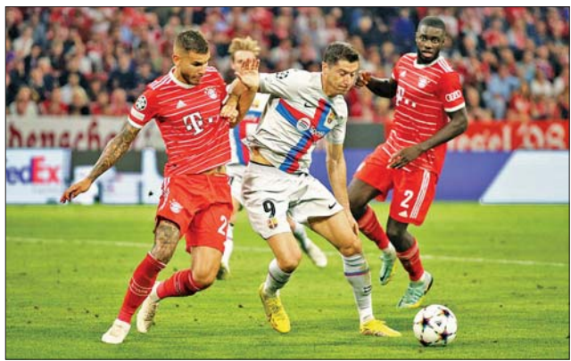
ဘိုင်ယန်မြူးနစ် နှင့် ဘာစီလိုနာ ယှဉ်ပြိုင်စဉ်။

ခါးစည်းအနက်အဆင့် တံခွန်စိုက် ခိုင်းဆုရ ရွှေ ၂ခု၊ ငွေ ၁ခု၊ ကြေး ၁ခု ရ အောင်ဆန်းအသင်း၊ ရွှေ ခြောက်ခု၊ ငွေတစ်ခု၊ ကြေးလေးခု ရ Dragon အသင်း၊ ရွှေသုံးခု၊ ငွေ သုံးခု၊ ကြေးခြောက်ခုရ စံပြဖိုက် တာ အသင်းတို့အား မြန်မာနိုင်ငံ တိုက်ကွမ်ဒိုအဖွဲ့ချုပ် ဥက္ကဋ္ဌ ဒေါက်တာ မြဟန်တို့က တံခွန်စိုက် ဖလားများ ပေးအပ်ချီးမြှင့်ခဲ့ကြ သည်။ အဆိုပါ ပြိုင်ပွဲကို အောက်တို ဘာ ၂၅ ရက်မှ ၂၉ ရက်အထိ ကျင်းပ ခဲ့ပြီး ကလပ်အသင်း ၁၃ သင်းမှ အားကစားသမား ၃၅၀ ကျော် ဝင်ရောက် ယှဉ်ပြိုင်ခဲ့ကြကြောင်း သိရသည်။ အာကာစိုး