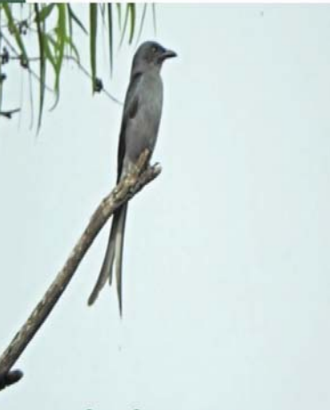
ငှက်တော်မဲ့ (Ashy Drongo)