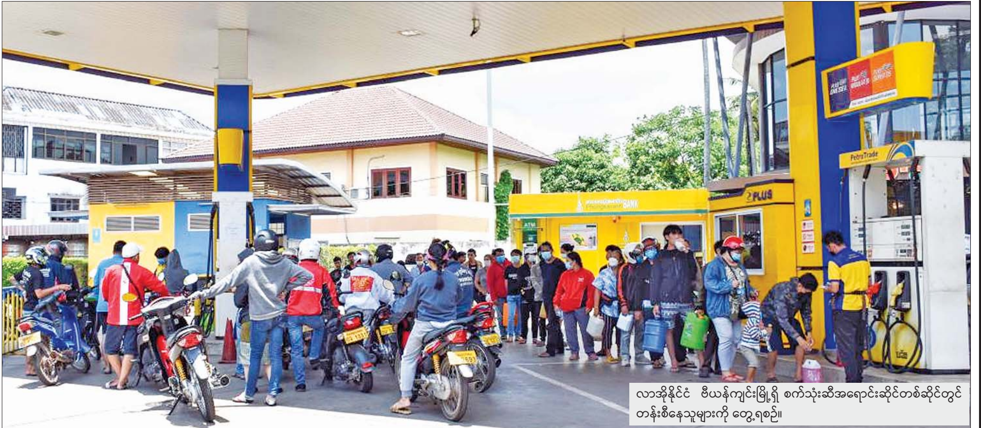
လာအိုနိုင်ငံ ဗီယက်ကျင်းမြို့ရှိ စက်သုံးဆီအရောင်းဆိုင်တစ်ဆိုင်တွင် တန်းစီနေသူများကို တွေ့ရစဉ်။