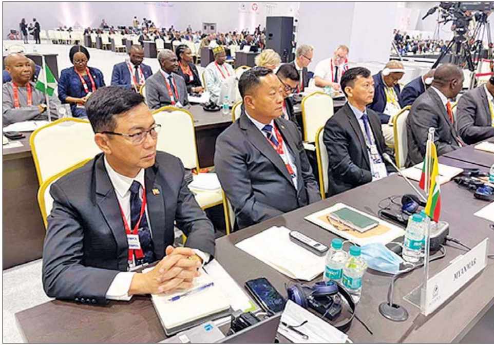
အကြိမ် (၉၀) မြောက် အင်တာပိုလ်အထွေထွေညီလာခံ(90 th INTERPOL General Assembly)သို့ ပြည်ထဲရေးဝန်ကြီးဌာန ဒုတိယဝန်ကြီး မြန်မာနိုင်ငံရဲတပ်ဖွဲ့ ရဲချုပ် ဗိုလ်ချုပ် ဇင်မင်းထက် ဦးဆောင်သည့် မြန်မာကိုယ်စားလှယ်အဖွဲ့ တက်ရောက်စဉ်။

ညီလာခံဒုတိယနေ့ အောက်တိုဘာ ၁၉ ရက်နှင့် တတိယနေ့ အောက်တိုဘာ ၂၀ ရက်တို့တွင် ယူကရိန်းနိုင်ငံရဲအဖွဲ့မှ တင်သွင်းသည့် အင်တာပိုလ် အဖွဲ့ဝင်အဖြစ်မှ ဆိုင်းငံ့ခြင်း သို့မဟုတ် ထုတ်ပယ်ခြင်း နှင့်စပ်လျဉ်းသည့် လုပ်ငန်းစဉ်ကို ဆွေးနွေးဆုံးဖြတ်