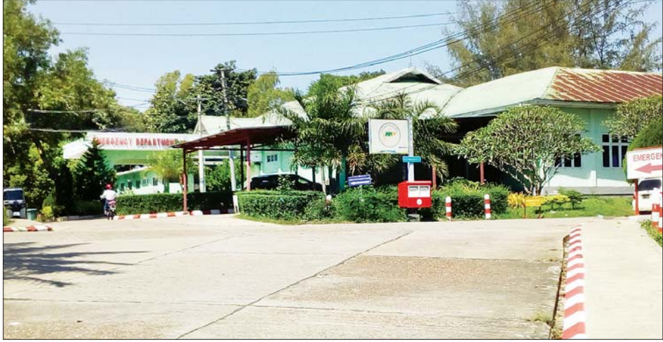
နေပြည်တော်အထွေထွေရောဂါကုဆေးရုံကြီး ခုတင်-၁၀၀၀။

နေပြည်တော် အောက်တိုဘာ ၂၄ နေပြည်တော် ခုတင်-၁၀၀၀ အထွေထွေရောဂါကုဆေးရုံကြီး၌ ယခင်ကကဲ့သို့ နေပြည်တော် အပါအဝင် ပြည်နယ်နှင့် တိုင်းဒေသကြီးများအတွင်းရှိ အနယ်နယ်အရပ်ရပ်မှ လာရောက် ဆေးကုသမှုခံယူသူ ဝေဒနာရှင်များအား ကျွမ်းကျင်သူ ပါမောက္ခများနှင့် အထူးကုဆရာဝန်ကြီးများက ဘာသာရပ်အလိုက် ကြည့်ရှုကုသမှုများ ပုံမှန်ဆောင်ရွက်ပေးလျက်ရှိကြောင်း ဆေးရုံအုပ်ကြီးထံမှ သိရသည်။