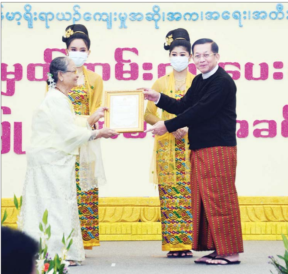
နိုင်ငံတော်စီမံအုပ်ချုပ်ရေးကောင်စီဥက္ကဋ္ဌ နိုင်ငံတော်ဝန်ကြီးချုပ် ဗိုလ်ချုပ်မှူးကြီး မင်းအောင်လှိုင် အဆိုအကဲဖြတ်လုပ်ငန်းအဖွဲ့ကိုယ်စား ဥက္ကဋ္ဌ ဒေါ်သင်းသင်းမြတ် အား ဂုဏ်ပြုမှတ်တမ်းလွှာ ပေးအပ်ချီးမြှင့်စဉ်။

အခမ်းအနားသို့ နိုင်ငံတော်စီမံအုပ်ချုပ်ရေးကောင်စီ ဥက္ကဋ္ဌ နိုင်ငံတော်ဝန်ကြီးချုပ်၏ ဇနီး ဒေါ်ကြူကြူလှ၊ ကောင်စီဒုတိယဥက္ကဋ္ဌ ဒုတိယဝန်ကြီးချုပ် ဒုတိယဗိုလ်ချုပ်မှူးကြီး စိုးဝင်း၊ ကောင်စီဝင်များနှင့်ဇနီးများ၊ ကောင်စီအတွင်းရေးမှူးနှင့် ဇနီး၊ ကောင်စီတွဲဖက်အတွင်းရေးမှူးနှင့် ဇနီး၊ ပြည်ထောင်စုဝန်ကြီးများနှင့် ဇနီးများ၊ ပြည်ထောင်စုအဆင့် ပုဂ္ဂိုလ်များ၊ နေပြည်တော်ကောင်စီဥက္ကဋ္ဌ တပ်မတော် အရာရှိကြီးများနှင့် ဇနီးများ၊ နေပြည်တော်တိုင်းစစ်ဌာနချုပ်တိုင်းမှူး၊ ဒုတိယဝန်ကြီးများ၊ ပြိုင်ပွဲကျင်းပရေး ဦးစီးကော်မတီ၊ လုပ်ငန်းကော်မတီနှင့် ဆပ်ကော်မတီများမှ တာဝန်ရှိသူများ၊ သက်ဆိုင်ရာဝန်ကြီးဌာနများမှ အထောက်အကူပြုအဖွဲ့များ၊ အကဲဖြတ် ပညာရှင်ကြီးများ၊ အုပ်ချုပ်သူများ၊ နည်းပြများနှင့် တာဝန်ရှိသူများ၊ တိုင်းဒေသကြီးနှင့် ပြည်နယ်အသီးသီးမှ ပြိုင်ပွဲဝင်အနုပညာရှင်များ တက်ရောက်ကြသည်။