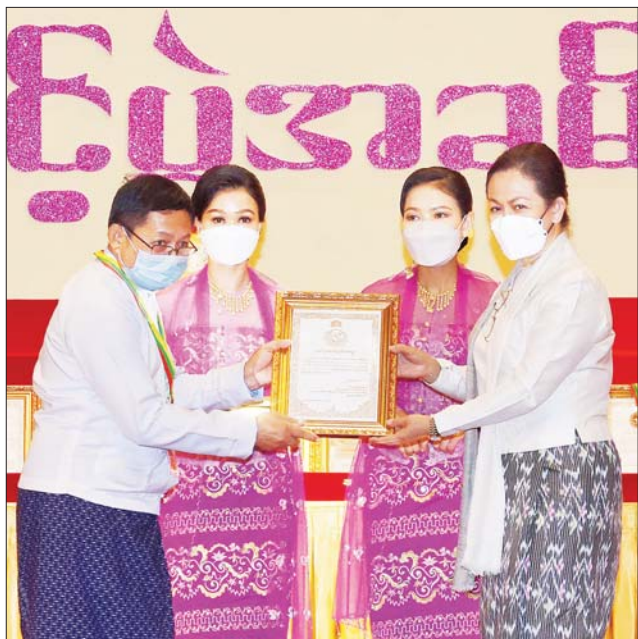
လူမှုဝန်ထမ်း၊ ကယ်ဆယ်ရေးနှင့် ပြန်လည်နေရာချထားရေးဝန်ကြီးဌာန ပြည်ထောင်စုဝန်ကြီး ဒေါက်တာ သက်သက်ခိုင် ဆုရရှိသူတစ်ဦးအား ဂုဏ်ပြုဆုတံဆိပ်နှင့် ဂုဏ်ပြုမှတ်တမ်းလွှာ ချီးမြှင့်စဉ်။