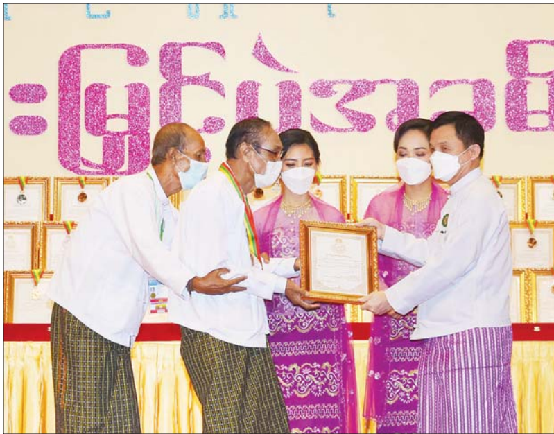
လူဝင်မှု ကြီးကြပ်ရေးနှင့် ပြည်သူ့ အင်အား ဝန်ကြီးဌာန ပြည်ထောင်စု ဝန်ကြီး ဦးမြင့်ကြိုင် ဆုရရှိသူတစ်ဦး အား ဂုဏ်ပြု ဆုတံဆိပ်နှင့် ဂုဏ်ပြု မှတ်တမ်းလွှာ ချီးမြှင့်စဉ်။