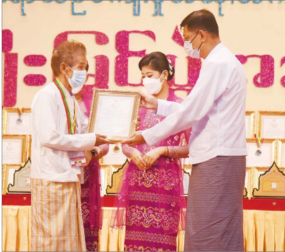
နိုင်ငံတော်စီမံအုပ်ချုပ်ရေးကောင်စီဝင် ဗိုလ်ချုပ်ကြီး မြထွန်းဦး ဆုရရှိသူတစ်ဦးအား ဂုဏ်ပြုဆုတံဆိပ်နှင့် ဂုဏ်ပြုမှတ်တမ်းလွှာ ပေးအပ်ချီးမြှင့်စဉ်။