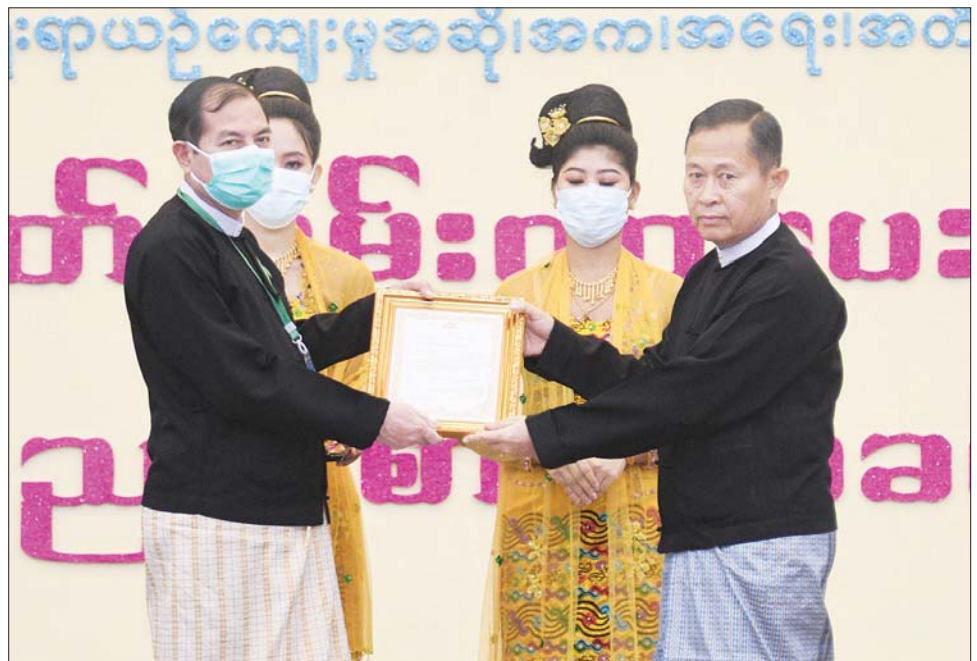
နိုင်ငံတော်စီမံအုပ်ချုပ်ရေးကောင်စီဒုတိယဥက္ကဋ္ဌ ဒုတိယဝန်ကြီးချုပ် ဒုတိယဗိုလ်ချုပ်မှူးကြီး စိုးဝင်း တိုင်းဒေသကြီးနှင့် ပြည်နယ်များမှ အုပ်ချုပ်သူတစ်ဦးအား ဂုဏ်ပြုမှတ်တမ်းလွှာ ချီးမြှင့်စဉ်။