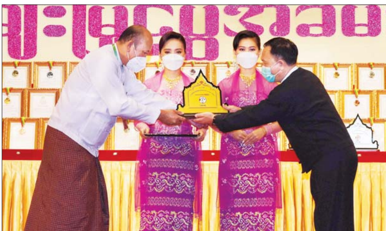
နိုင်ငံတော်စီမံအုပ်ချုပ်ရေးကောင်စီဝင် ဦးရွှေကြမ်း ဆုရရှိသူတစ်ဦးအား ဂုဏ်ပြုဆု တံဆိပ်နှင့် ဂုဏ်ပြုမှတ်တမ်းလွှာ ချီးမြှင့်စဉ်။