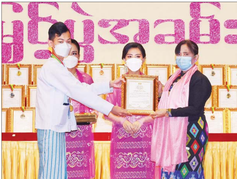
ပြည်ထောင်စု ရှေ့နေချုပ်နှင့် ဥပဒေရေးရာ ဝန်ကြီးဌာန ပြည်ထောင်စု ဝန်ကြီး ဒေါက်တာ သီတာဦး ဆုရရှိသူတစ်ဦး အား ဂုဏ်ပြု ဆုတံဆိပ်နှင့် ဂုဏ်ပြု မှတ်တမ်းလွှာ ချီးမြှင့်စဉ်။