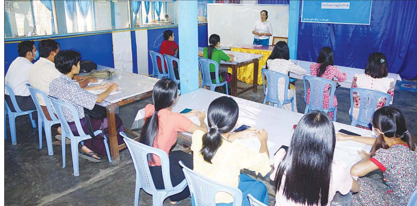
အဆိုပါ သင်တန်းတက်ရောက်ခြင်း အားဖြင့် သတင်းတာဝန်ထမ်းဆောင်လျက် ရှိသော ဝန်ထမ်းများ၏ စွမ်းဆောင်ရည်များ ယခင်ကထက် ပိုမိုမြင့်မားလာနိုင်ပြီး ပြည်သူများအနေဖြင့် နယ်မြေဒေသအတွင်းရှိ သတင်းများကို တိကျမှန်ကန်စွာဖြင့် အချိန် နှင့်တစ်ပြေးညီ သိရှိလာနိုင်တော့မည် ဖြစ်ကြောင်း သိရသည်။ ထက်တံခွန် (တာမွေ)

(ဆိပ်ကမ်း)မြို့နယ်၊ ဒဂုံမြို့သစ်(တောင်ပိုင်း) မြို့နယ်၊ ဒဂုံမြို့သစ်(မြောက်ပိုင်း) မြို့နယ်၊ ဒဂုံမြို့သစ် (အရှေ့ပိုင်း)မြို့နယ်၊ ဒေါပုံမြို့နယ်၊ ဗိုလ်တစ်ထောင်မြို့နယ်၊ ပုဇွန်တောင်မြို့နယ်၊ မင်္ဂလာတောင်ညွန့်မြို့နယ်၊ မြောက်ဥက္ကလာပ မြို့နယ်၊ ရန်ကင်းမြို့နယ်နှင့် သာကေတမြို့နယ် တို့တွင် သတင်းတာဝန်ထမ်းဆောင်လျက် ရှိသော ဝန်ထမ်း ၂၀ အား သတင်းဆိုသည့် အဓိပ္ပာယ်၊ သတင်းဓာတ်ပုံရိုက်ကူးနည်း၊ သတင်းအချက်အလက် စုဆောင်းနည်း၊ သတင်းနှင့် သတင်းဆောင်းပါးတို့ကို သဒ္ဒါ အသုံးအနှုန်း၊ ဝါကျဖွဲ့စည်းပုံနှင့် သတ်ပုံစာလုံး ပေါင်း မှန်ကန်ပြီး နည်းစနစ်ကျကျ ရေးသား နည်းများကို စာတွေ့လက်တွေ့ သင်ကြားပို့ချ ပေးခဲ့ကြောင်း သိရသည်။