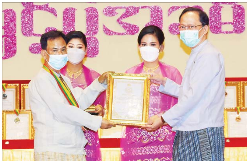
ဆောက်လုပ်ရေးဝန်ကြီးဌာန ပြည်ထောင်စု ဝန်ကြီး ဦးရွှေလေး ဆုရရှိသူ တစ်ဦးအား ဂုဏ်ပြု ဆုတံဆိပ်နှင့် ဂုဏ်ပြု မှတ်တမ်းလွှာ ချီးမြှင့်စဉ်။