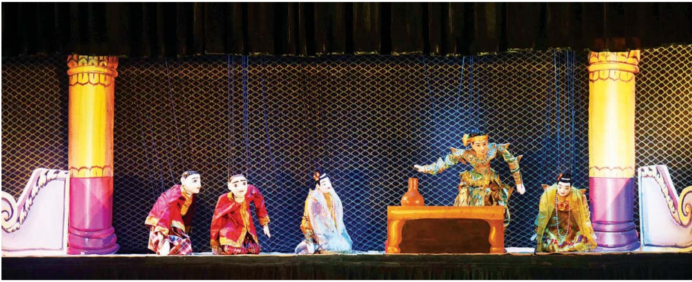
ဝါသနာရှင် ပထမတန်းအဆင့် ရုပ်စုံသဘင်အဖွဲ့လိုက်ပြိုင်ပွဲ ပထမဆုရ ပဲခူးတိုင်းဒေသကြီးမှ မိုးပြည့်မြင့်မိုရ် ရုပ်စုံသဘင်အဖွဲ့ကပြယှဉ်ပြိုင်စဉ်။