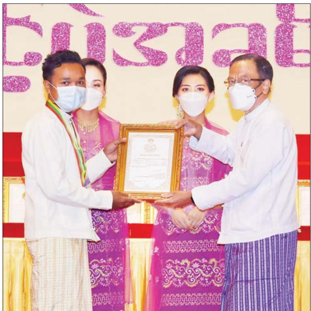
ဟိုတယ်နှင့်ခရီးသွားလာရေးဝန်ကြီးဌာန ပြည်ထောင်စုဝန်ကြီး ဦးဌေးအောင် ဆုရရှိသူတစ်ဦးအား ဂုဏ်ပြုဆုတံဆိပ်နှင့် ဂုဏ်ပြု မှတ်တမ်းလွှာ ချီးမြှင့်စဉ်။