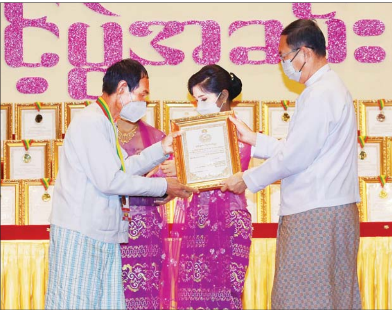
သယံဇာတနှင့် သဘာဝ ပတ်ဝန်းကျင် ထိန်းသိမ်းရေး ဝန်ကြီးဌာန ပြည်ထောင်စု ဝန်ကြီး ဦးခင်မောင်ရီ ဆုရရှိသူတစ်ဦး အား ဂုဏ်ပြု ဆုတံဆိပ်နှင့် ဂုဏ်ပြု မှတ်တမ်းလွှာ ချီးမြှင့်စဉ်။