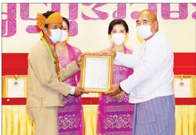
ပြည်ထောင်စုစာရင်းစစ်ချုပ် ဦးတင်ဦး ဆုရရှိသူတစ်ဦးအား ဂုဏ်ပြု ဆုတံဆိပ်နှင့် ဂုဏ်ပြုမှတ်တမ်းလွှာ ချီးမြှင့်စဉ်။