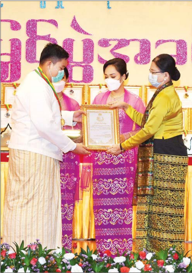
နိုင်ငံတော်စီမံအုပ်ချုပ်ရေးကောင်စီဝင် ဒေါ်အေးနုစိန် ဆုရရှိသူ တစ်ဦးအား ဂုဏ်ပြုဆုတံဆိပ်နှင့် ဂုဏ်ပြုမှတ်တမ်းလွှာ ချီးမြှင့်စဉ်။