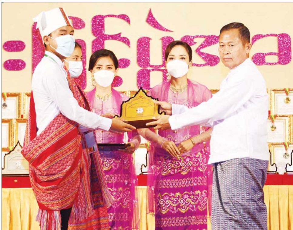
နိုင်ငံတော်စီမံအုပ်ချုပ်ရေးကောင်စီ ဒုတိယဥက္ကဋ္ဌ ဒုတိယဝန်ကြီးချုပ် ဒုတိယဗိုလ်ချုပ်မှူးကြီး စိုးဝင်း ချင်းပြည်နယ် တိုင်းရင်းသားရိုးရာနှင့် ကျေးလက်ရိုးရာ ယဉ်ကျေးမှုအဖွဲ့အား ဂုဏ်ပြုဆုချီးမြှင့်စဉ်။