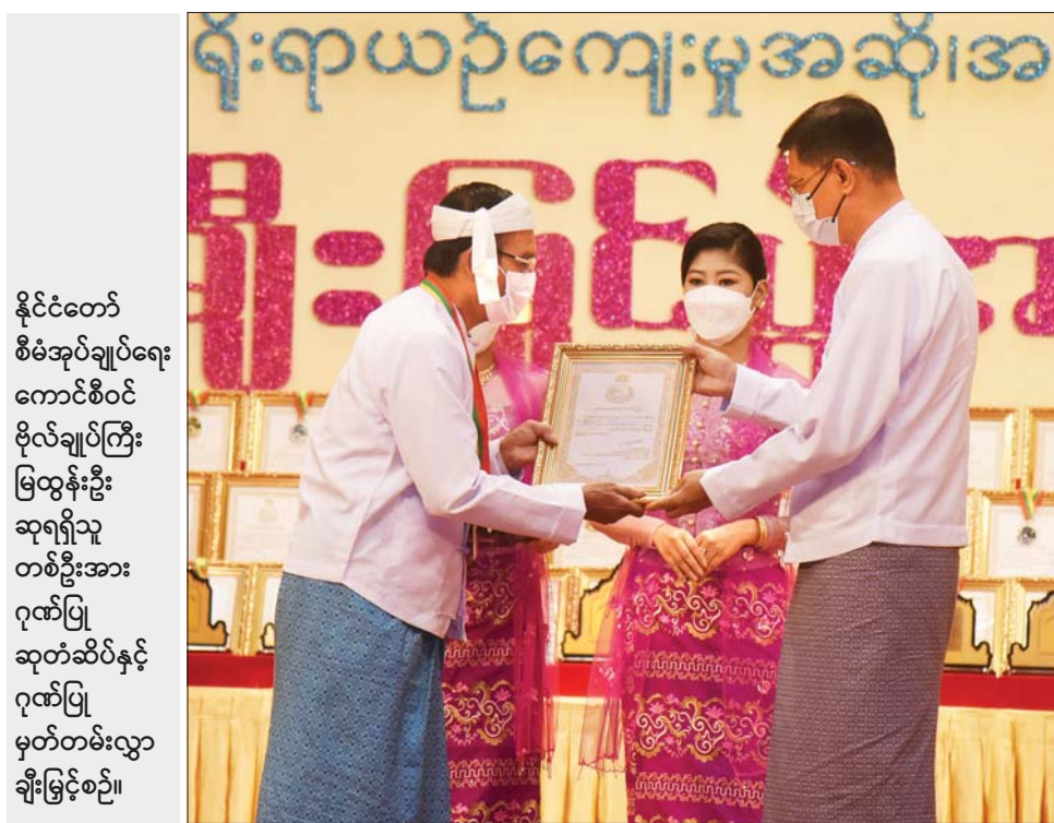
နိုင်ငံတော် စီမံအုပ်ချုပ်ရေး ကောင်စီဝင် ဗိုလ်ချုပ်ကြီး မြထွန်းဦး ဆုရရှိသူ တစ်ဦးအား ဂုဏ်ပြု ဆုတံဆိပ်နှင့် ဂုဏ်ပြု မှတ်တမ်းလွှာ ချီးမြှင့်စဉ်။