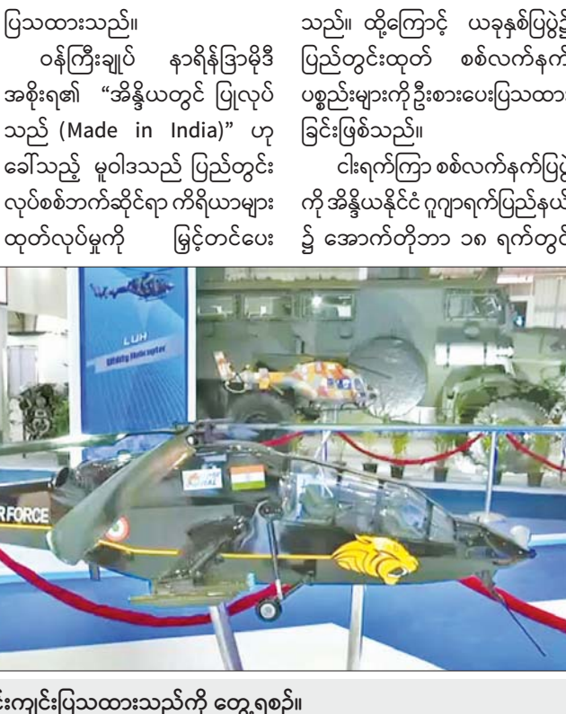
အိန္ဒိယလုပ် လေယာဉ်တစ်စင်း ခင်းကျင်းပြသထားသည်ကို တွေ့ရစဉ်။

နယူးဒေလီ အောက်တိုဘာ ၁၈ အိန္ဒိယနိုင်ငံသည် နိုင်ငံတကာ စစ်လက်နက်ပစ္စည်း ပြပွဲကို ခင်းကျင်း ပြသလျက်ရှိသည်။ ယခုနှစ်တွင် ပြည်တွင်းထုတ် စစ်လေယာဉ်များနှင့် သံချပ် ကာယာဉ်များကို ဦးစားပေး ပြသထားသည်။ ဝန်ကြီးချုပ် နာရိန်ဒြာမိုဒီ အစိုးရ၏ “အိန္ဒိယတွင် ပြုလုပ် သည် (Made in India)” ဟု ခေါ်သည့် မူဝါဒသည် ပြည်တွင်း ထုတ်လုပ်မှုကို ကြီးကြပ်စောင့်ကြည့် ထုတ်လုပ်မှုကို မြှင့်တင်ပေး သည်။ ထို့ကြောင့် ယခုနှစ်ပြပွဲ၌ ပြည်တွင်းထုတ် စစ်လက်နက် ပစ္စည်းများကို ဦးစားပေးပြသ ထားခြင်းဖြစ်သည်။ ငါးရက်ကြာ စစ်လက်နက်ပြပွဲ ကို အိန္ဒိယနိုင်ငံ ဂျာဂရက်ပြည်နယ် ၌ အောက်တိုဘာ ၁၈ ရက်တွင် ဖွင့်လှစ်ခဲ့သည်။ အဆိုပါပြပွဲ၌ အိန္ဒိယနှင့် ကမ္ဘာတစ်ဝန်းမှ ကုမ္ပဏီပေါင်း ၁၃၀၀ ဝင်ရောက် ပြသခဲ့သည်။ ပြပွဲတွင် ဆွဲဆောင်မှုအရှိဆုံး ခင်းကျင်းပြသမှုမှာ အိန္ဒိယနိုင်ငံ လုပ် အပေးစားတိုက်ခိုက်ရေး ရဟတ်ယာဉ်ဖြစ်ပြီး ယခုလတွင် အိန္ဒိယလေတပ်တွင် စတင်အသုံး ပြုမည်ဖြစ်သည်။ ဆွီဒင်သုတေသနအင်စတီကျု အရ လွန်ခဲ့သော နှစ်ပေါင်း ၂၀ အတွင်းအိန္ဒိယနိုင်ငံသို့ တင်သွင်း သော စစ်လက်နက်ပစ္စည်း အားလုံး၏ ၆၇ ရာခိုင်နှုန်းမှာ ရုရှားလုပ်များဖြစ်ကြသည်။ အိန္ဒိယသည် ပြည်တွင်းထုတ် စစ်လက်နက်များကို ပိုမိုတိုးတက် ထုတ်လုပ်သွားမည်ဖြစ်သည်။ အင်ဒိုနီးရှားနိုင်ငံ