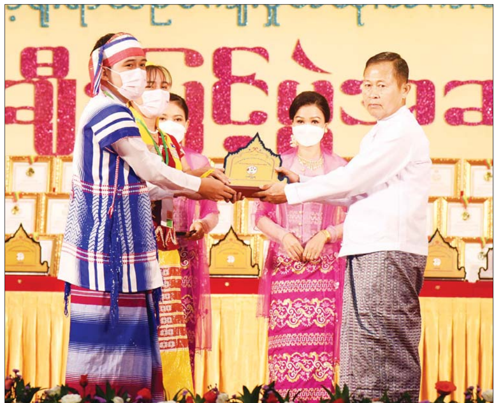
နိုင်ငံတော်စီမံအုပ်ချုပ်ရေးကောင်စီ ဒုတိယဥက္ကဋ္ဌ ဒုတိယဝန်ကြီးချုပ် ဒုတိယဗိုလ်ချုပ်မှူးကြီး စိုးဝင်း ကရင်ပြည်နယ် တိုင်းရင်းသားရိုးရာနှင့် ကျေးလက်ရိုးရာ ယဉ်ကျေးမှုအဖွဲ့အား ဂုဏ်ပြုဆုချီးမြှင့်စဉ်။