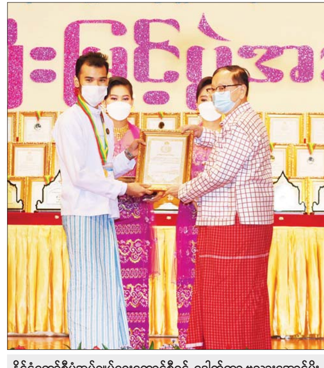
နိုင်ငံတော်စီမံအုပ်ချုပ်ရေးကောင်စီဝင် ဒေါက်တာ ဗညားအောင်မိုး ဆုရရှိသူ တစ်ဦးအား ဂုဏ်ပြုဆုတံဆိပ်နှင့် ဂုဏ်ပြုမှတ်တမ်းလွှာ ချီးမြှင့်စဉ်။