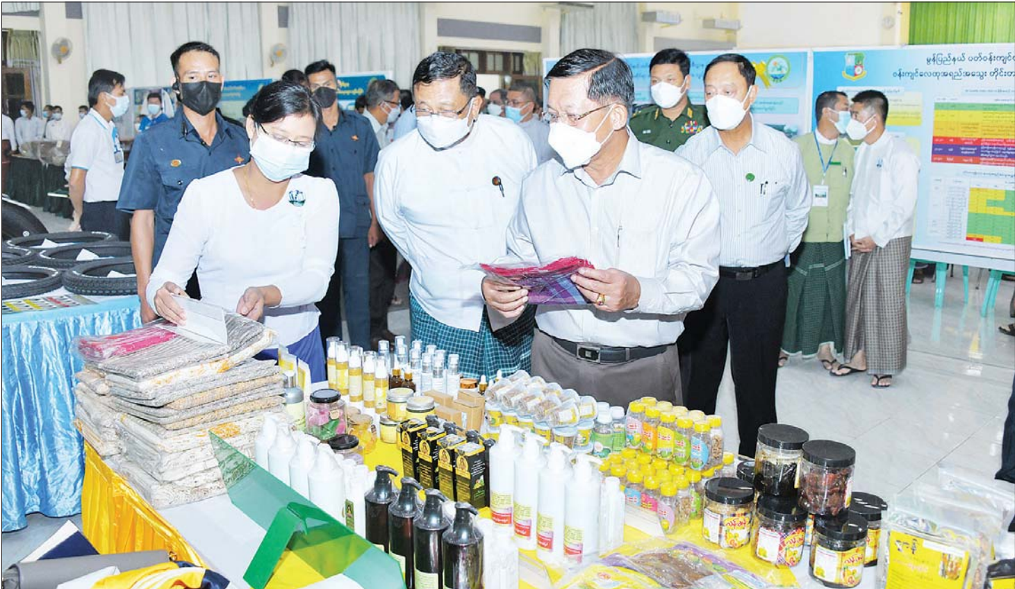
နိုင်ငံတော်စီမံအုပ်ချုပ်ရေးကောင်စီဥက္ကဋ္ဌ နိုင်ငံတော်ဝန်ကြီးချုပ် ဗိုလ်ချုပ်မှူးကြီး မင်းအောင်လှိုင် ခင်းကျင်းပြသထားသည့် ဒေသထုတ်ကုန်ပစ္စည်းများကို ကြည့်ရှုလေ့လာစဉ်။

လုပ်ငန်းများဆောင်ရွက်ရန်အတွက် အရည်အချင်း ပြည့်ဝသည့် လူသားအရင်းအမြစ်များလည်း လိုအပ်ကြောင်း၊ ပညာရည်မြင့်မားရေးအတွက် မိမိတို့အနေဖြင့် ကြိုးပမ်းဆောင်ရွက်လျက်ရှိကြောင်း၊ မွန်ပြည်နယ်သည် ပညာရေးအားပေးသည့် ပြည်နယ်တစ်ခုဖြစ်ပြီး တက္ကသိုလ်ဝင်တန်းအောင်မြင်မှုတွင် ပထမ ရခဲ့ကြောင်း၊ ယင်းအတွက် ချီးကျူးပါကြောင်း၊ KG + 9 အောင်မြင်ပြီးချိန်တွင် တက်ရောက်နိုင်ရေး စက်မှုလက်မှု၊ စိုက်ပျိုးရေး၊ မွေးမြူရေး အထက်တန်း