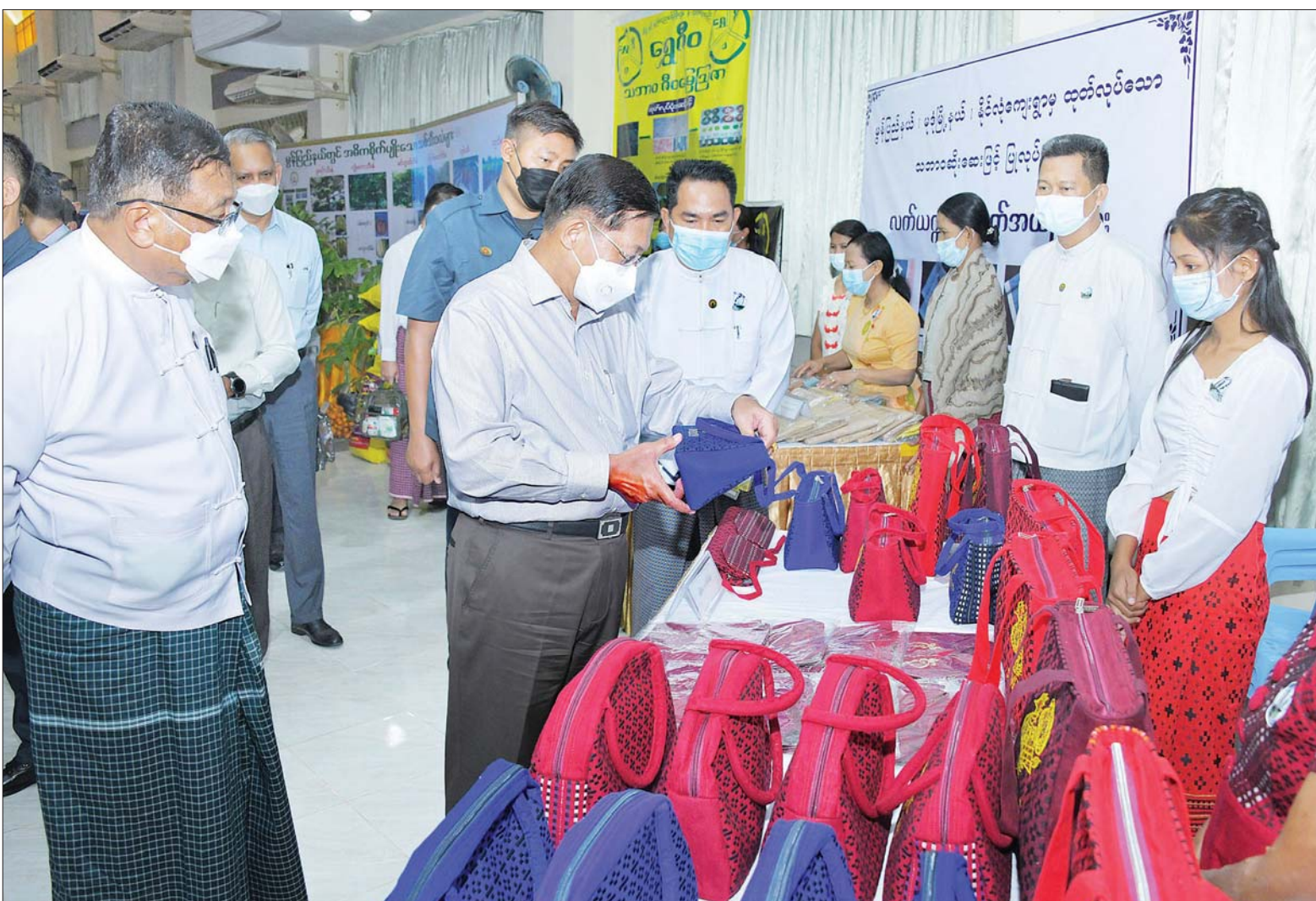
နိုင်ငံတော်စီမံအုပ်ချုပ်ရေးကောင်စီဥက္ကဋ္ဌ နိုင်ငံတော်ဝန်ကြီးချုပ် ဗိုလ်ချုပ်မှူးကြီး မင်းအောင်လှိုင် မွန်ပြည်နယ်အတွင်းရှိ အသေးစား၊ အငယ်စားနှင့် အလတ်စား စီးပွားရေး (MSME) လုပ်ငန်းရှင်များအား တွေ့ဆုံပွဲတွင် ခင်းကျင်းပြသထားသည့် ဒေသထုတ်ကုန်ပစ္စည်းများကို ကြည့်ရှုလေ့လာစဉ်။

နေပြည်တော် အောက်တိုဘာ ၁၈ နိုင်ငံတော်စီမံအုပ်ချုပ်ရေးကောင်စီ ဥက္ကဋ္ဌ နိုင်ငံတော်ဝန်ကြီးချုပ် ဗိုလ်ချုပ်မှူးကြီး မင်းအောင်လှိုင် သည် ယနေ့နံနက်ပိုင်းတွင် မွန်ပြည်နယ်အတွင်း ရှိအသေးစား၊ အငယ်စားနှင့် အလတ်စား စီးပွားရေး (MSME) လုပ်ငန်းရှင်များအား မော်လမြိုင်မြို့ရှိ ပြည်နယ်ခန့်မှန်း တွေ့ဆုံ၍ ဒေသတွင်းစီးပွားရေးလုပ်ငန်းများ ဖွံ့ဖြိုးတိုးတက်ရေးအတွက် ဆွေးနွေးပြောကြားသည်။ အဆိုပါ တွေ့ဆုံပွဲသို့ နိုင်ငံတော်စီမံအုပ်ချုပ်ရေးကောင်စီဥက္ကဋ္ဌ နိုင်ငံတော်ဝန်ကြီးချုပ်နှင့်အတူ ကောင်စီတွဲဖက်အတွင်းရေးမှူး ဒုတိယဗိုလ်ချုပ်ကြီး ရဲဝင်းဦး၊ ပြည်ထောင်စုဝန်ကြီးများ ဖြစ်ကြသည့် ဦးဝင်းရှိန်၊ ဒေါက်တာ ကင်စော်၊ ဦးတင်ထွဋ်ဦး၊ ဦးလှမိုး၊ ဒေါက်တာ ချာလီသန်း၊ ဦးအောင်နိုင်ဦးနှင့် မွန်ပြည်နယ်ဝန်ကြီးချုပ် ဦးစော်လင်းထွန်း၊ ညွှန်ကြားကွပ်ကဲရေးမှူး (ကြည်း၊ ရေ၊ လေ) ဗိုလ်ချုပ်ကြီး မောင်မောင်အေး၊ ကာကွယ်ရေးဦးစီးချုပ်ရုံးမှ တပ်မတော်အရာရှိကြီးများ၊ အရှေ့တောင်တိုင်း စစ်ဌာနချုပ် တိုင်းမှူးနှင့် တာဝန်ရှိသူများ၊ ပြည်နယ်အစိုးရအဖွဲ့ဝင်များ၊ မွန်ပြည်နယ်ရှိ အသေးစား၊ အငယ်စားနှင့် အလတ်စား စီးပွားရေး (MSME) လုပ်ငန်းရှင်များ တက်ရောက်ကြသည်။ စာမျက်နှာ ၃ ကော်လံ ၁ ❖