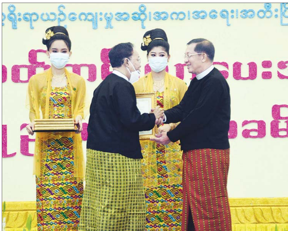
နိုင်ငံတော်စီမံအုပ်ချုပ်ရေးကောင်စီဥက္ကဋ္ဌ နိုင်ငံတော်ဝန်ကြီးချုပ် ဗိုလ်ချုပ်မှူးကြီး မင်းအောင်လှိုင် အကအကဲဖြတ်လုပ်ငန်းအဖွဲ့ ကိုယ်စား ဥက္ကဋ္ဌ ဦးအောင်တင်ဝင်းအား ဂုဏ်ပြုမှတ်တမ်းလွှာ ချီးမြှင့်စဉ်။

နိုင်ငံတော်စီမံအုပ်ချုပ်ရေး ကောင်စီဥက္ကဋ္ဌ နိုင်ငံတော် ဝန်ကြီးချုပ် ဗိုလ်ချုပ်မှူးကြီး မင်းအောင်လှိုင် (၂၃) ကြိမ်မြောက် မြန်မာ့ရိုးရာ ယဉ်ကျေးမှု အဆို၊ အက၊ အရေး၊ အတီးပြိုင်ပွဲ ဂုဏ်ပြုမှတ်တမ်းလွှာ ပေးအပ်ပွဲနှင့် ဂုဏ်ပြုညစာစားပွဲ အခမ်းအနားတွင် ဂုဏ်ပြုအမှာစကား ပြောကြားစဉ်။