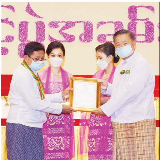
တိုင်းရင်းသားလူမျိုးများရေးရာဝန်ကြီးဌာန ပြည်ထောင်စုဝန်ကြီး ဦးစောထွန်းအောင်မြင့် ဆုရရှိသူတစ်ဦးအား ဂုဏ်ပြုဆုတံဆိပ်နှင့် ဂုဏ်ပြုမှတ်တမ်းလွှာ ချီးမြှင့်စဉ်။