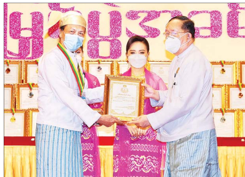
ပြည်ထောင်စု တရားသူကြီးချုပ် ဦးထွန်းထွန်းဦး အရေးပြိုင်ပွဲတွင် ဆုရရှိသူတစ်ဦးအား ဂုဏ်ပြုဆုတံဆိပ်နှင့် ဂုဏ်ပြုမှတ်တမ်းလွှာ ချီးမြှင့်စဉ်။