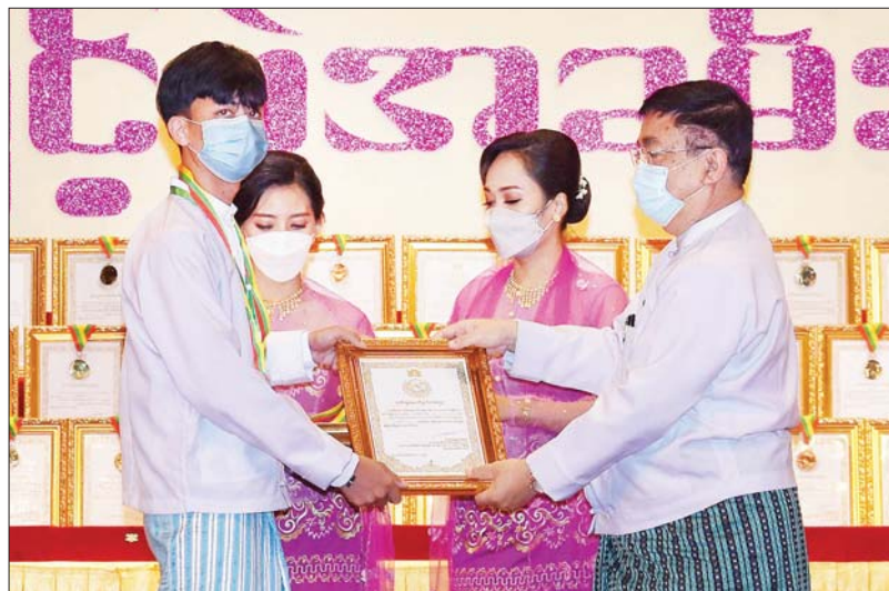
ပညာရေး ဝန်ကြီးဌာန ပြည်ထောင်စု ဝန်ကြီး ဒေါက်တာ ညွန့်ဖေ ဆုရရှိသူ တစ်ဦးအား ဂုဏ်ပြု ဆုတံဆိပ်နှင့် ဂုဏ်ပြု မှတ်တမ်းလွှာ ချီးမြှင့်စဉ်။