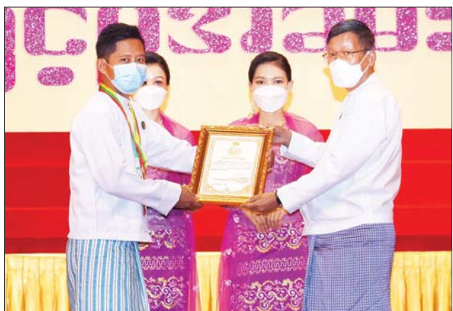
နေပြည်တော်ကောင်စီဥက္ကဋ္ဌ ဦးတင်ဦးလွင် ဆုရရှိသူတစ်ဦးအား ဂုဏ်ပြုဆုတံဆိပ်နှင့် ဂုဏ်ပြုမှတ်တမ်းလွှာ ချီးမြှင့်စဉ်။