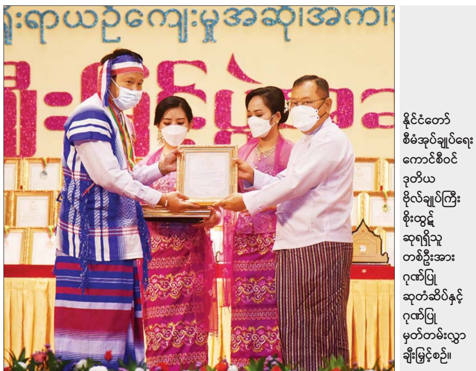
နိုင်ငံတော် စီမံအုပ်ချုပ်ရေး ကောင်စီဝင် ဒုတိယ ဗိုလ်ချုပ်ကြီး စိုးထွန်း ဆုရရှိသူ တစ်ဦးအား ဂုဏ်ပြု ဆုတံဆိပ်နှင့် ဂုဏ်ပြု မှတ်တမ်းလွှာ ချီးမြှင့်စဉ်။