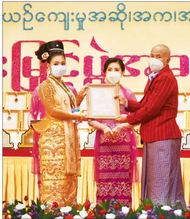
နိုင်ငံတော်စီမံအုပ်ချုပ်ရေးကောင်စီဝင် စောဒန်နိယယ် ဆုရရှိသူ တစ်ဦးအား ဂုဏ်ပြုဆုတံဆိပ်နှင့် ဂုဏ်ပြုမှတ်တမ်းလွှာ ချီးမြှင့်စဉ်။