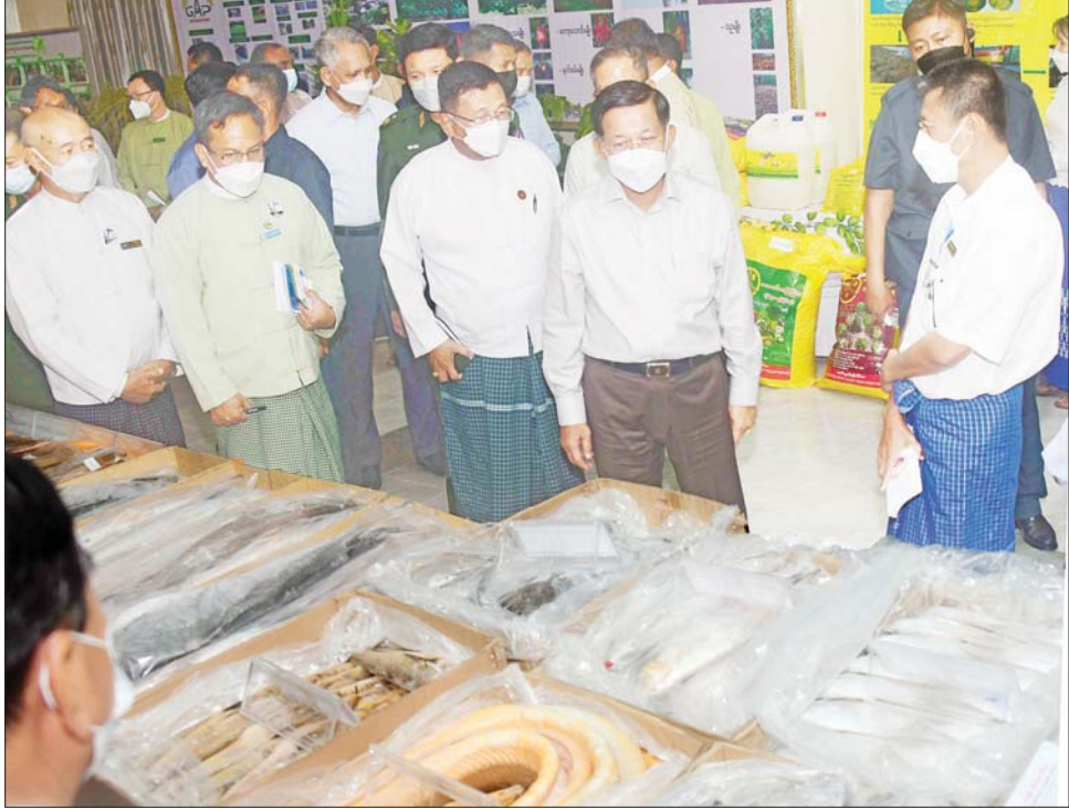
နိုင်ငံတော်စီမံအုပ်ချုပ်ရေးကောင်စီဥက္ကဋ္ဌ နိုင်ငံတော်ဝန်ကြီးချုပ် ဗိုလ်ချုပ်မှူးကြီး မင်းအောင်လှိုင် ခင်းကျင်းပြသထားသည့် ဒေသထုတ်ကုန်ပစ္စည်းများကို ကြည့်ရှုလေ့လာစဉ်။