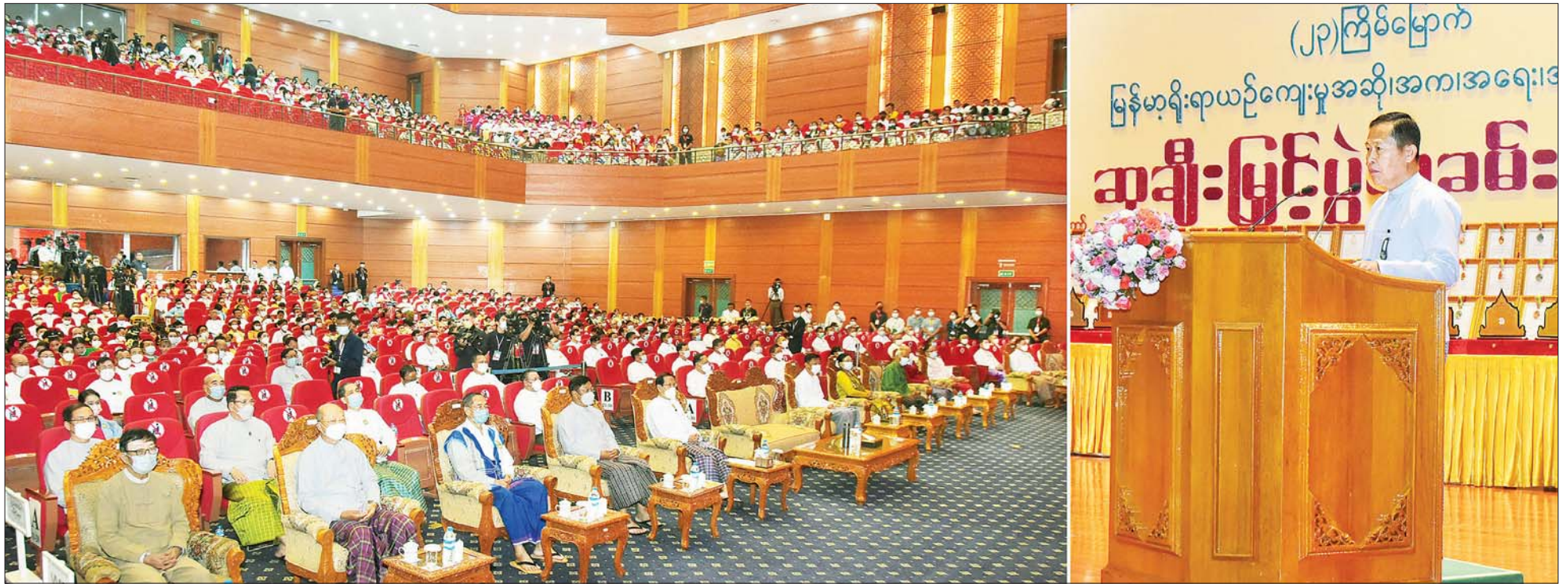
နိုင်ငံတော်စီမံအုပ်ချုပ်ရေးကောင်စီ ဒုတိယဥက္ကဋ္ဌ ဒုတိယဝန်ကြီးချုပ် ဒုတိယဗိုလ်ချုပ်မှူးကြီး စိုးဝင်း (၂၃) ကြိမ်မြောက် မြန်မာ့ရိုးရာယဉ်ကျေးမှု အဆို၊ အက၊ အရေး၊ အတီးပြိုင်ပွဲ ဆုချီးမြှင့်ပွဲ အခမ်းအနားတွင် အမှာစကား ပြောကြားစဉ်။