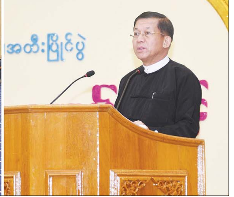
နိုင်ငံတော်စီမံအုပ်ချုပ်ရေးကောင်စီဥက္ကဋ္ဌ နိုင်ငံတော်ဝန်ကြီးချုပ် ဗိုလ်ချုပ်မှူးကြီး မင်းအောင်လှိုင် (၂၃)ကြိမ်မြောက် မြန်မာ့ရိုးရာယဉ်ကျေးမှု အဆို၊ အက၊ အရေး၊ အတီးပြိုင်ပွဲ ဂုဏ်ပြုမှတ်တမ်းလွှာပေးအပ်ပွဲနှင့် ဂုဏ်ပြုညစာ စားပွဲအခမ်းအနားတွင် ဂုဏ်ပြုအမှာစကားပြောကြားစဉ်။