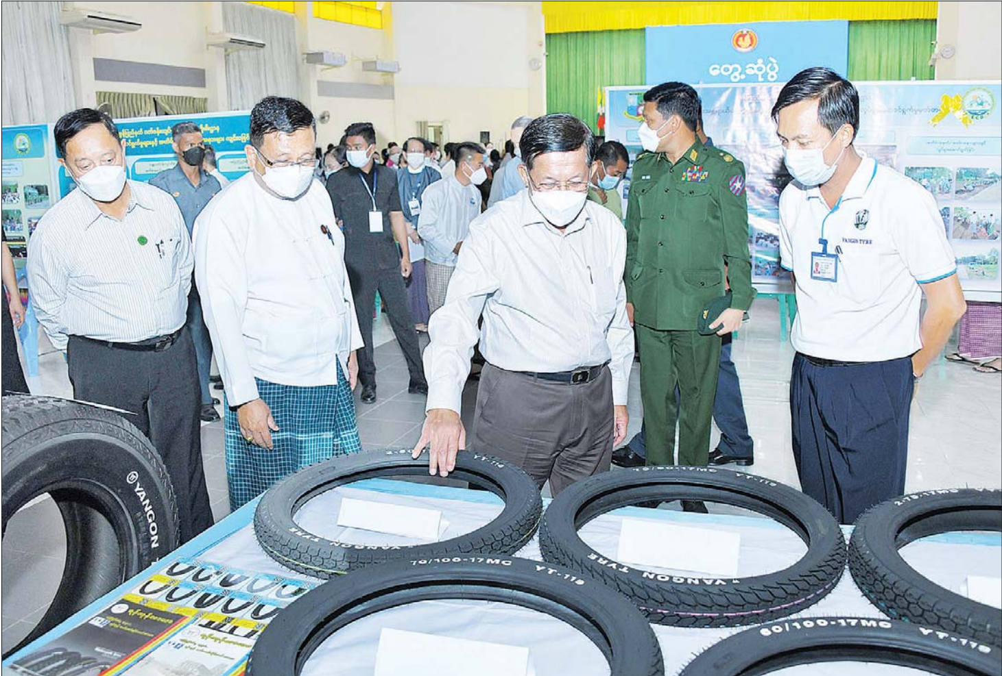
နိုင်ငံတော်စီမံအုပ်ချုပ်ရေးကောင်စီဥက္ကဋ္ဌ နိုင်ငံတော်ဝန်ကြီးချုပ် ဗိုလ်ချုပ်မှူးကြီး မင်းအောင်လှိုင် မွန်ပြည်နယ်အတွင်းရှိ အသေးစား၊ အငယ်စားနှင့် အလတ်စား စီးပွားရေး (MSME) လုပ်ငန်းရှင်များအား တွေ့ဆုံပွဲတွင် ခင်းကျင်းပြသထားသည့် ဒေသထုတ်ကုန်ပစ္စည်းများကို ကြည့်ရှုလေ့လာစဉ်။

မော်လမြိုင်တွင် ယခင်က ပင်လယ်ဆိပ်ကမ်းရှိခဲ့သော်လည်း အကြောင်းအမျိုးမျိုးကြောင့် ယခုအသုံးပြုမှုမရှိကြောင်း၊ မော်လမြိုင်ဒေသတွင် ပင်လယ်ဆိပ်ကမ်းတစ်ခု တည်ဆောက်နိုင်ရေးအတွက် မိမိတို့အနေဖြင့် စီမံဆောင်ရွက်လျက်ရှိကြောင်း၊ အလားတူ မော်လမြိုင်ဒေသတွင် အပြည်ပြည်ဆိုင်ရာ လေဆိပ်တည်ဆောက်နိုင်ရေးအတွက် စီမံဆောင်ရွက်လျက်ရှိကြောင်း၊ နောင်တစ်ချိန်တွင် မော်လမြိုင်ဒေသသို့