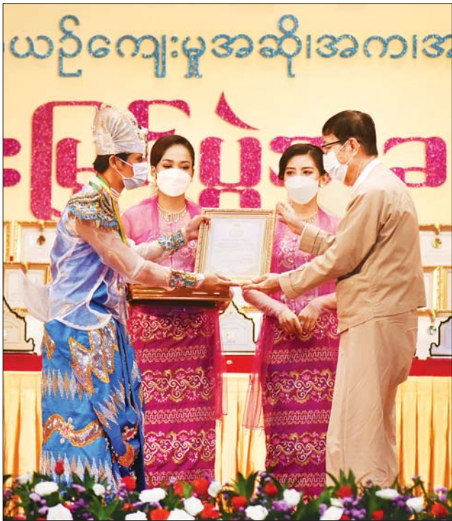
နိုင်ငံတော်စီမံအုပ်ချုပ်ရေးကောင်စီဝင် ဦးစိုင်းလုံးဆိုင် ဆုရရှိသူ တစ်ဦးအား ဂုဏ်ပြုဆုတံဆိပ်နှင့် ဂုဏ်ပြုမှတ်တမ်းလွှာ ချီးမြှင့်စဉ်။