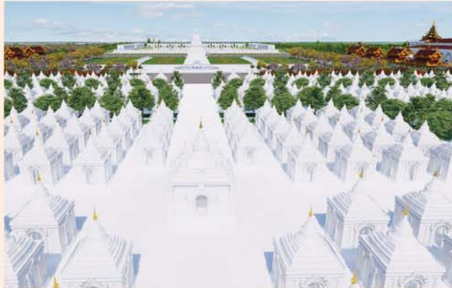
ကျောက်စာရုံစေတီ(၁၂ x ၁၂x ၁၈)ပေ ၁ ဆူ တန်ဖိုး- ၂၇၉ သိန်း