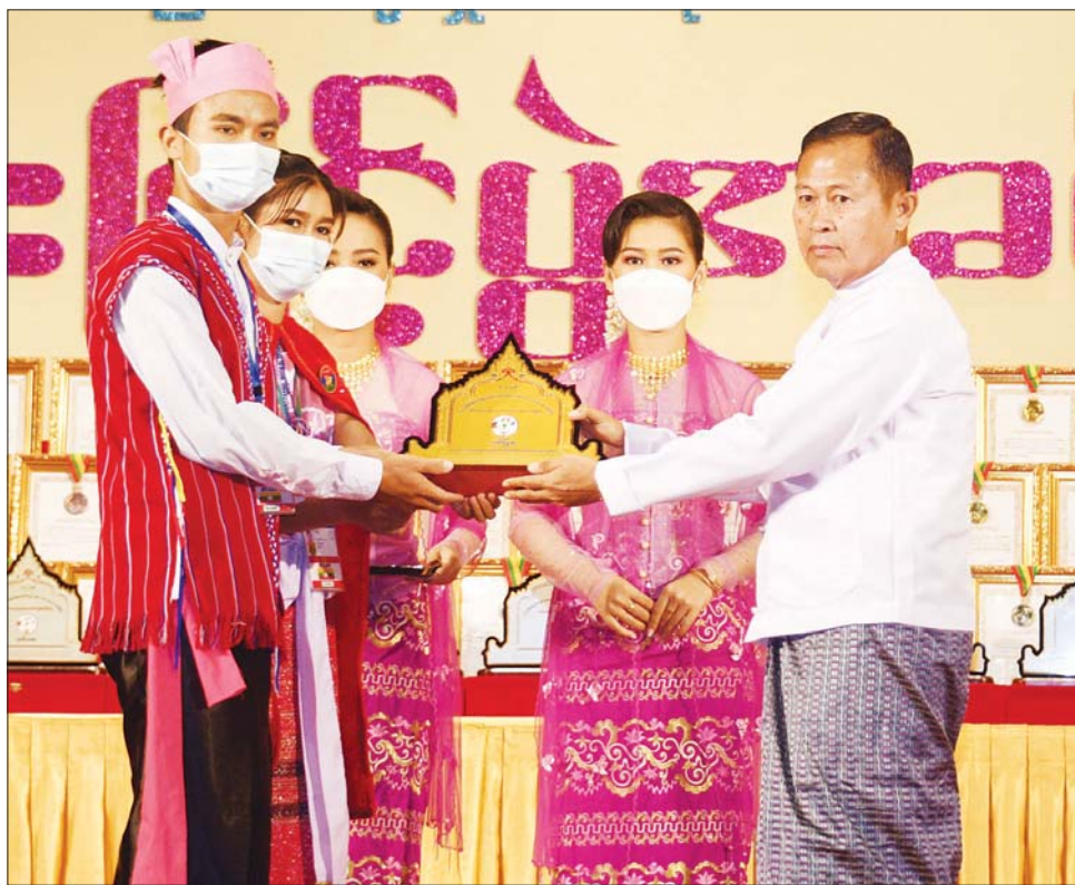
နိုင်ငံတော်စီမံအုပ်ချုပ်ရေးကောင်စီ ဒုတိယဥက္ကဋ္ဌ ဒုတိယဝန်ကြီးချုပ် ဒုတိယဗိုလ်ချုပ်မှူးကြီး စိုးဝင်း ကယားပြည်နယ် တိုင်းရင်းသားရိုးရာနှင့် ကျေးလက်ရိုးရာ ယဉ်ကျေးမှုအဖွဲ့အား ဂုဏ်ပြုဆုချီးမြှင့်စဉ်။