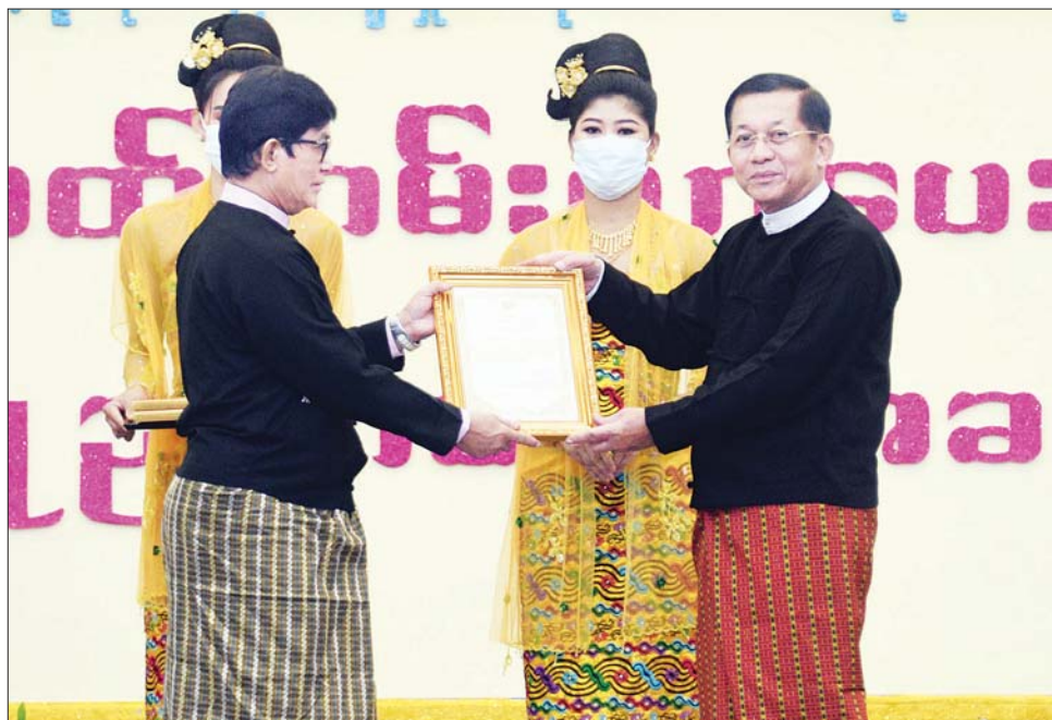
နိုင်ငံတော်စီမံအုပ်ချုပ်ရေးကောင်စီဥက္ကဋ္ဌ နိုင်ငံတော်ဝန်ကြီးချုပ် ဗိုလ်ချုပ်မှူးကြီး မင်းအောင်လှိုင် အတီးအကဲဖြတ်လုပ်ငန်းအဖွဲ့ ကိုယ်စား ဥက္ကဋ္ဌ ဦးအောင်ကိန်းအား ဂုဏ်ပြုမှတ်တမ်းလွှာ ချီးမြှင့်စဉ်။