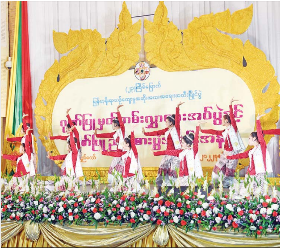
(၂၃) ကြိမ်မြောက် မြန်မာ့ရိုးရာယဉ်ကျေးမှု အဆို၊ အက၊ အရေး၊ အတီးပြိုင်ပွဲ ဂုဏ်ပြုမှတ်တမ်းလွှာပေးအပ်ပွဲနှင့် ဂုဏ်ပြုညစာစားပွဲ အခမ်းအနားတွင် သာသနာရေးနှင့် ယဉ်ကျေးမှုဝန်ကြီးဌာန အနုပညာဦးစီးဌာနမှ အနုပညာရှင်များ သီဆို ကပြဖျော်ဖြေစဉ်။