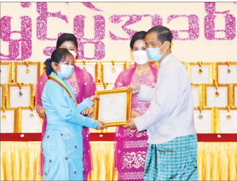
အပြည်ပြည် ဆိုင်ရာ ပူးပေါင်း ဆောင်ရွက်ရေး ဝန်ကြီးဌာန ပြည်ထောင်စု ဝန်ကြီး ဦးကိုကိုလှိုင် ဆုရရှိသူတစ်ဦး အား ဂုဏ်ပြု ဆုတံဆိပ်နှင့် ဂုဏ်ပြု မှတ်တမ်းလွှာ ချီးမြှင့်စဉ်။