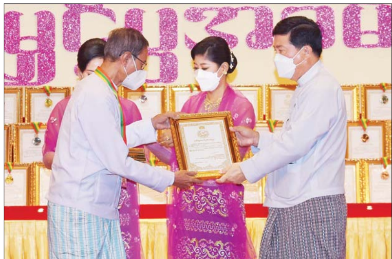
အလုပ်သမား ဝန်ကြီးဌာန ပြည်ထောင်စု ဝန်ကြီး ဒေါက်တာ ပွင့်ဆန်း ဆုရရှိသူ တစ်ဦးအား ဂုဏ်ပြု ဆုတံဆိပ်နှင့် ဂုဏ်ပြု မှတ်တမ်းလွှာ ချီးမြှင့်စဉ်။