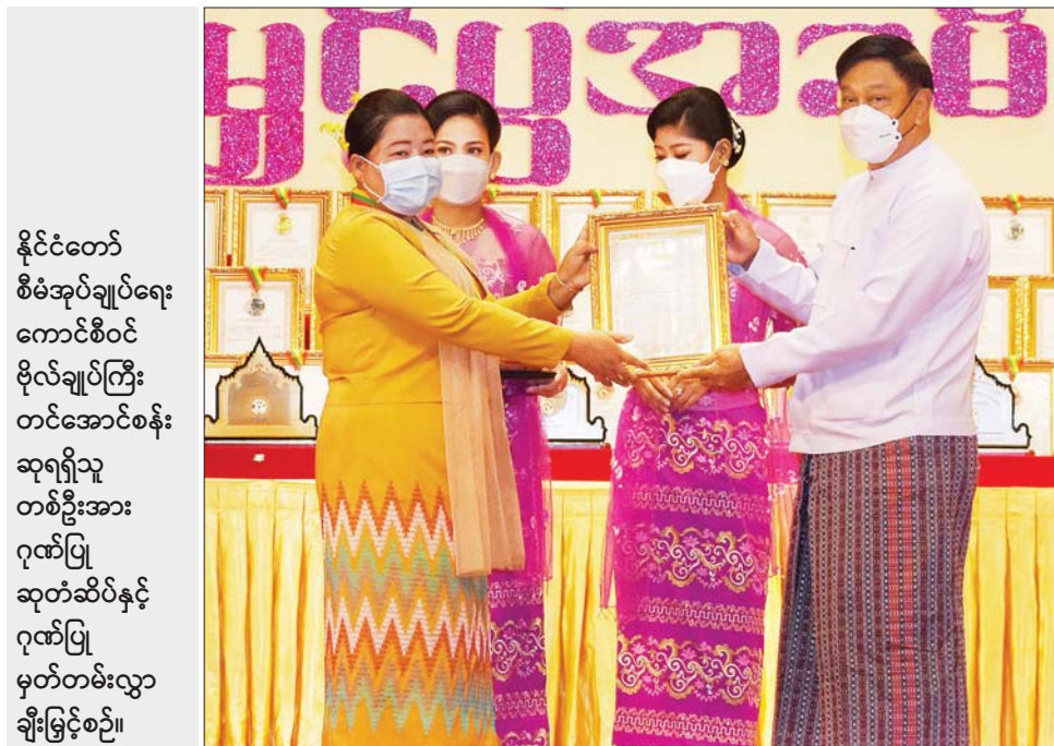
နိုင်ငံတော် စီမံအုပ်ချုပ်ရေး ကောင်စီဝင် ဒုတိယ ဗိုလ်ချုပ်ကြီး တင်အောင်စန်း ဆုရရှိသူ တစ်ဦးအား ဂုဏ်ပြု ဆုတံဆိပ်နှင့် ဂုဏ်ပြု မှတ်တမ်းလွှာ ချီးမြှင့်စဉ်။