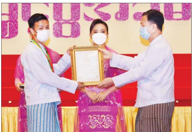
ပြည်ထောင်စုရာထူးဝန်ဥက္ကဋ္ဌ ဒေါက်တာ မောင်မောင်နိုင် ဆုရရှိသူ တစ်ဦးအား ဂုဏ်ပြုဆုတံဆိပ်နှင့် ဂုဏ်ပြုမှတ်တမ်းလွှာ ချီးမြှင့်စဉ်။