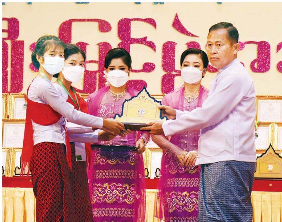
နိုင်ငံတော်စီမံအုပ်ချုပ်ရေးကောင်စီ ဒုတိယဥက္ကဋ္ဌ ဒုတိယဝန်ကြီးချုပ် ဒုတိယဗိုလ်ချုပ်မှူးကြီး စိုးဝင်း မွန်ပြည်နယ် တိုင်းရင်းသားရိုးရာနှင့် ကျေးလက်ရိုးရာ ယဉ်ကျေးမှုအဖွဲ့အား ဂုဏ်ပြုဆုချီးမြှင့်စဉ်။