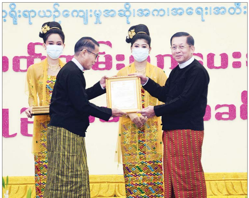
နိုင်ငံတော်စီမံအုပ်ချုပ်ရေးကောင်စီဥက္ကဋ္ဌ နိုင်ငံတော်ဝန်ကြီးချုပ် ဗိုလ်ချုပ်မှူးကြီး မင်းအောင်လှိုင် အရေးအကဲဖြတ်လုပ်ငန်းအဖွဲ့ ကိုယ်စား အတွင်းရေးမှူး ဦးမင်းယုအား ဂုဏ်ပြုမှတ်တမ်းလွှာ ချီးမြှင့်စဉ်။