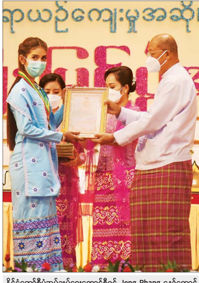
နိုင်ငံတော်စီမံအုပ်ချုပ်ရေးကောင်စီဝင် Jeng Phang နော်တောင် ဆုရရှိသူတစ်ဦးအား ဂုဏ်ပြုဆုတံဆိပ်နှင့် ဂုဏ်ပြုမှတ်တမ်းလွှာ ချီးမြှင့်စဉ်။