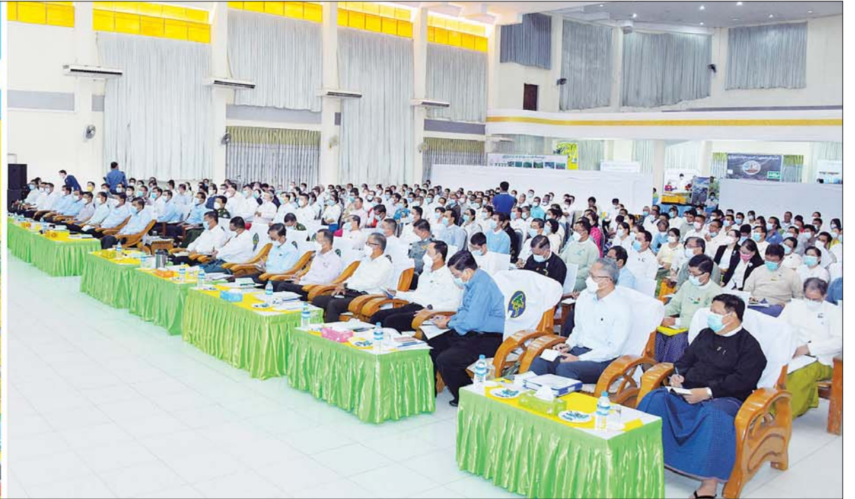
နိုင်ငံတော်စီမံအုပ်ချုပ်ရေးကောင်စီဥက္ကဋ္ဌ နိုင်ငံတော်ဝန်ကြီးချုပ် ဗိုလ်ချုပ်မှူးကြီး မင်းအောင်လှိုင် မွန်ပြည်နယ်အတွင်းရှိ အသေးစား၊ အငယ်စားနှင့် အလတ်စား စီးပွားရေး (MSME) လုပ်ငန်းရှင်များအား တွေ့ဆုံအမှာစကားပြောကြားစဉ်။