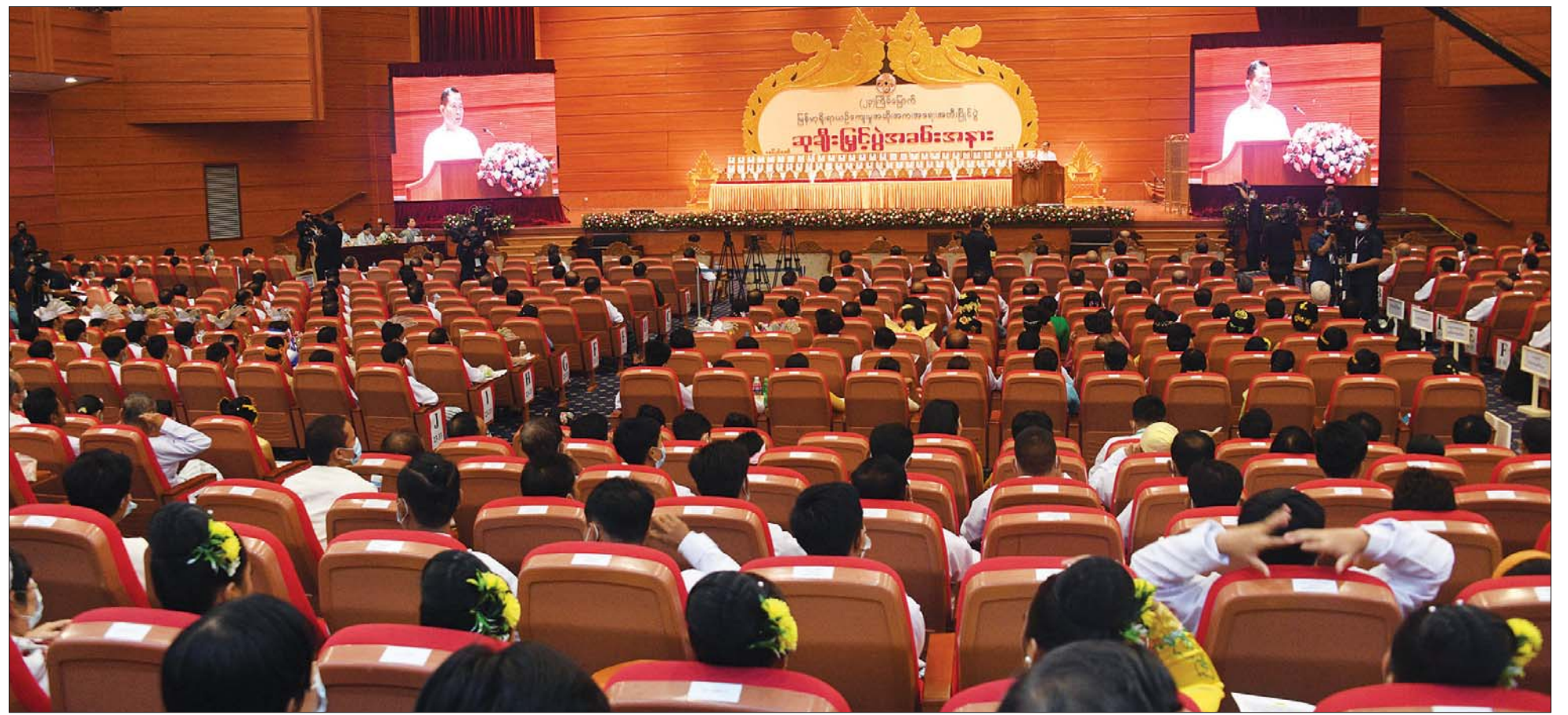
နိုင်ငံတော်စီမံအုပ်ချုပ်ရေးကောင်စီ ဒုတိယဥက္ကဋ္ဌ ဒုတိယဝန်ကြီးချုပ် ဒုတိယဗိုလ်ချုပ်မှူးကြီး စိုးဝင်း (၂၃)ကြိမ်မြောက် မြန်မာ့ရိုးရာယဉ်ကျေးမှု အဆို၊ အက၊ အရေး၊ အတီးပြိုင်ပွဲ ဆုချီးမြှင့်ပွဲ အခမ်းအနားတွင် အမှာစကားပြောကြားစဉ်။