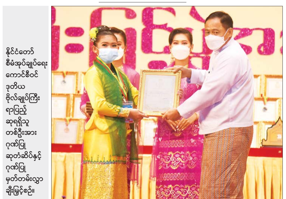
နိုင်ငံတော် စီမံအုပ်ချုပ်ရေး ကောင်စီဝင် ဒုတိယ ဗိုလ်ချုပ်ကြီး ရာပြည့် ဆုရရှိသူ တစ်ဦးအား ဂုဏ်ပြု ဆုတံဆိပ်နှင့် ဂုဏ်ပြု မှတ်တမ်းလွှာ ချီးမြှင့်စဉ်။