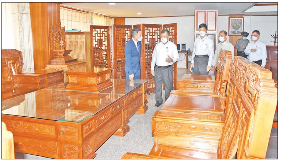
ဆက်လက်၍ တိုင်းဒေသကြီး ဝန်ကြီးချုပ်နှင့် အဖွဲ့သည် ပုသိမ်မြို့နယ် ဘိုတက်ကုန်းကျေးရွာ အုပ်စု သန့်ဇင်ကုန်းကျေးရွာရှိ ၂၀၂၀ ပြည့်နှစ်က စတင်ဖွင့်လှစ်ခဲ့သည့် မန္တလေးမြို့တော် စည်ပင်သာယာရေးကော်မတီ၏ မြို့တော်ပန်းဈေးသို့

အဆိုပါ မြစ်ဝါသစ်အချောထည် စက်ရုံကို ၁၉၉၉ ခုနှစ်ကစတင်ခဲ့ပြီး ထုတ်လုပ်မှုအနေဖြင့် ပါကေး၊ ပရိဘောဂပစ္စည်း၊ တံခါး၊ ဆက်တီမျိုးစုံ တို့ကို ထုတ်လုပ်လျက်ရှိပြီး ပြည်တွင်း ပြည်ပနိုင်ငံများသို့ တင်ပို့လျက်ရှိသည်။