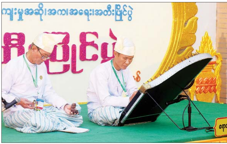
ခုံမင်းပြိုင်ပွဲ ဝါသနာရှင်အဆင့် (ပထမတန်း) အမျိုးသားပြိုင်ပွဲတွင် ဧရာဝတီတိုင်း ဒေသကြီးမှ ပါဝင်ယှဉ်ပြိုင်စဉ်။

မန္တလေးတိုင်းဒေသကြီးနှင့် ချင်းပြည်နယ် တို့မှ ပြိုင်ပွဲဝင်များက “လေပြည်ဆော် သွင်းမြူး” (ယိုးဒယား) ဖြင့်လည်းကောင်း၊ ဧရာဝတီတိုင်းဒေသကြီးနှင့် ရန်ကုန်တိုင်း ဒေသကြီးတို့မှ ပြိုင်ပွဲဝင်များက “ဆဒွန် အိုင်သာ” (သီချင်းခံ) ဖြင့် လည်းကောင်း၊ အခြေခံပညာအဆင့် (အသက် ၁၀ နှစ်မှ ၁၅ နှစ်အတွင်း) အမျိုးသားပြိုင်ပွဲတွင် ရန်ကုန်တိုင်းဒေသကြီးမှ ပြိုင်ပွဲဝင်က “ထွေတလာ” (ကြိုး) ဖြင့် လည်းကောင်း၊ ရှမ်းပြည်နယ်နှင့် စစ်ကိုင်းတိုင်းဒေသကြီး တို့မှ ပြိုင်ပွဲဝင်များက “စိမ်းလဲ့လဲ့ညိုပြာ” (ကြိုး) ဖြင့် လည်းကောင်း၊ မန္တလေးတိုင်း ဒေသကြီးမှ ပြိုင်ပွဲဝင်က “လာချေပြီ” (ကြိုး) ဖြင့် လည်းကောင်း၊ အဆင့်မြင့် ပညာအဆင့် အမျိုးသားပြိုင်ပွဲတွင် မန္တလေးတိုင်းဒေသကြီးမှ ပြိုင်ပွဲဝင်က “ကျွန်းကျွန်းပိုင်သ” (ကြိုး) ဖြင့် လည်း ကောင်း၊ ဝါသနာရှင်အဆင့် (ပထမတန်း) အမျိုးသားပြိုင်ပွဲတွင် ရန်ကုန်တိုင်းဒေသ ကြီးမှ ပြိုင်ပွဲဝင်က “မန်းတောင်လက်ရာ” (ယိုးဒယား) ဖြင့် လည်းကောင်း၊ ချင်း