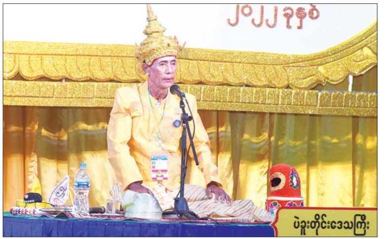
ကွက်စိပ်ပြိုင်ပွဲ ဝါသနာရှင်အဆင့် (ပထမတန်း) အမျိုးသားပြိုင်ပွဲတွင် ပဲခူးတိုင်း ဒေသကြီးမှ ပါဝင်ယှဉ်ပြိုင်စဉ်။

ကွက်စိပ်ပြိုင်ပွဲကို အမျိုးသားစာကြည့် တိုက် (နေပြည်တော်) ရှိ ဝန်ဇင်းမင်း ရာဇခန်းမ၌ ကျင်းပရာ ဝါသနာရှင် အဆင့် (ပထမတန်း) အမျိုးသားပြိုင်ပွဲတွင်