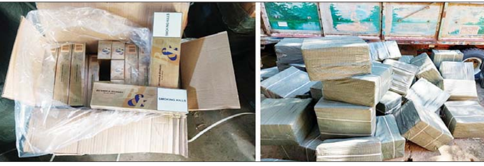
စစ်ကိုင်းတိုင်းဒေသကြီး၌ ဖမ်းဆီးရမိသည့် တရားမဝင်ကုန်ပစ္စည်းများ

သစ်တောဥပဒေနှင့်အညီ အရေးယူဆောင်ရွက် ထို့ပြင် ပဲခူးတိုင်းဒေသကြီး တရားမဝင် ကုန်သွယ်မှု တိုက်ဖျက်ရေးအထူးအဖွဲ့၏ စီမံခန့်ခွဲမှု ဖြင့် တိုင်းဒေသကြီး သစ်တောဦးစီးဌာနဦးဆောင် သော ပူးပေါင်းစစ်ဆေးရေးအဖွဲ့က စစ်ဆေးမှုများ ဆောင်ရွက်ခဲ့ရာ တောင်ငူခရိုင်၊ ညောင်လေးပင်ခရိုင် နှင့် သာယာဝတီခရိုင်များအတွင်း တရားမဝင် သစ်မျိုးစုံ ၃၉ ဒဿမ ၉၉၄ တန် (ခန့်မှန်းတန်ဖိုးငွေကျပ် ၁၅၁၃၆၀၅၄)ကို ဖမ်းဆီးရမိခဲ့ပြီး သစ်တောဥပဒေ နှင့်အညီ အရေးယူဆောင်ရွက်လျက်ရှိသည်။ သို့ဖြစ်ပါ၍ အောက်တိုဘာလ ၁၃ ရက်၊ ၁၄ ရက်နှင့် ၁၅ ရက်တို့တွင် ဖမ်းဆီးရမိမှုစုစုပေါင်းမှာ အမှုတွဲ ကိုးမှု (ခန့်မှန်းတန်ဖိုးငွေကျပ် ၁၇၀၀၀၈၉၇၈) ဖြစ်ကြောင်း တရားမဝင် ကုန်သွယ်မှုတိုက်ဖျက်ရေး ဦးဆောင်ကော်မတီမှ သိရသည်။