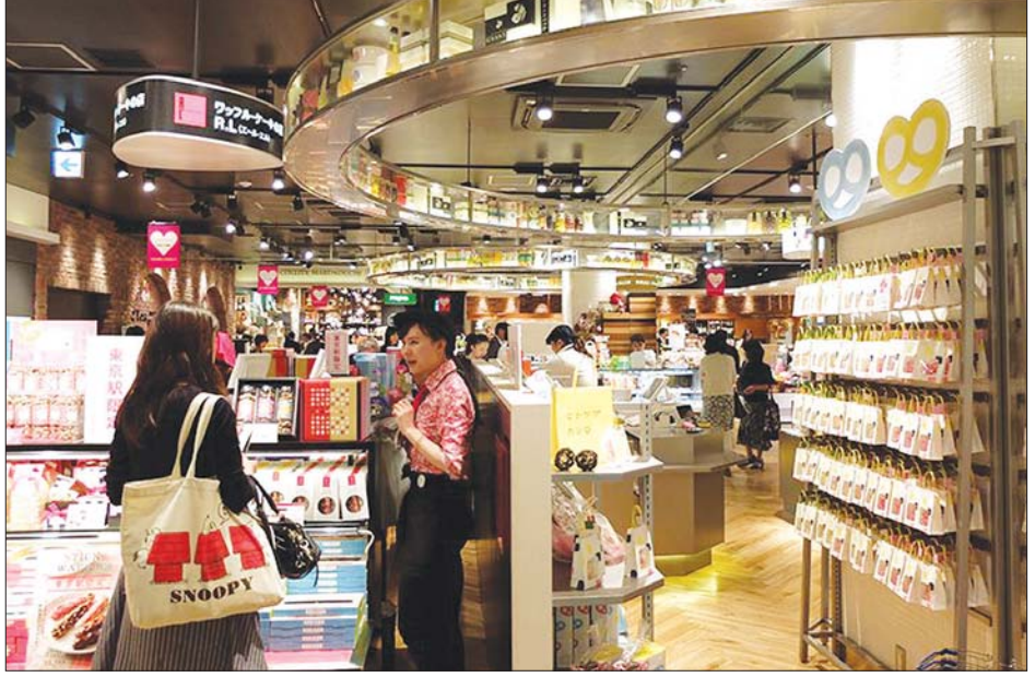
တိုကျိုဘူတာရုံအတွင်းရှိ ဈေးဆိုင်ခန်းများ။

ရည်ညွှန်း Where Japan's railways stand after 150 years of evolution by Tim Hornyak (Japan Times Newspaper) 8-10-2022