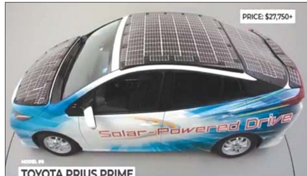
ဆိုလာစနစ်သုံး EV ယာဉ် နမူနာပုံများ။