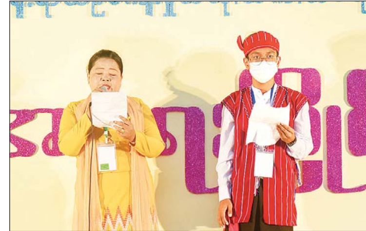
အဆိုပြိုင်ပွဲအဆင့်မြင့်ပညာ အမျိုးသမီးပြိုင်ပွဲတွင် မွန်ပြည်နယ်မှ ပါဝင်ယှဉ်ပြိုင်စဉ်။