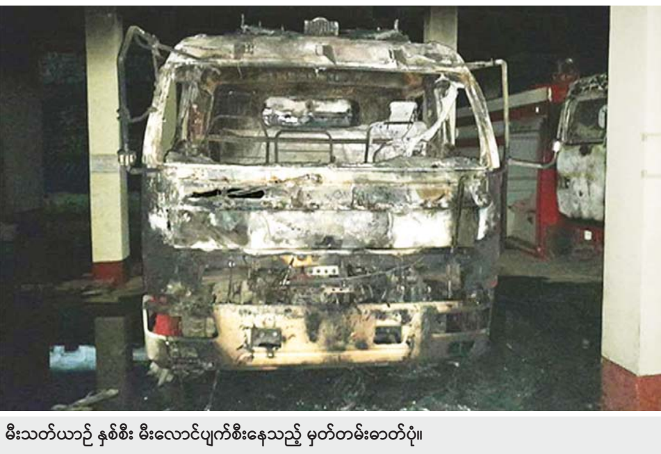
မီးသတ်ယာဉ် နှစ်စီး မီးလောင်ပျက်စီးနေသည့် မှတ်တမ်းဓာတ်ပုံ။

နေပြည်တော် အောက်တိုဘာ ၁၅ အကြမ်းဖက်သမားများအနေဖြင့် တည်ငြိမ်အေးချမ်းမှုကို ပျက်ပြားစေရန်နှင့် ပြည်သူလူထု အထိတ်တလန့်ဖြစ်စေရန် ရည်ရွယ်၍ လက်ပစ်ဗုံးများ၊ လက်လှုပ်ဗုံးများ၊ လက်လှုပ်မိုင်းများ၊ လက်နက်ကြီး၊ လက်နက်ငယ်များကို အသုံးပြု၍ အများပြည်သူ သွားလာလှုပ်ရှားနေသော လမ်းမကြီးများ၊ စာသင်ကျောင်းများ၊ ပြည်သူ့ပိုင်ဆိုင်ဆောက်အုတ်အုတ်များ၊ အများပြည်သူများနှင့် သက်ဆိုင်သည့်နေရာများ၊ စစ်ရေးနှင့် မသက်ဆိုင်သည့် နေရာများ၊ အစိုးရရုံး၊ ဌာနများနှင့် အဆောက်အအုံများကို ဖောက်ခွဲဖျက်ဆီး၊ ပစ်ခတ်၊ တိုက်ခိုက်နေသဖြင့် ချင်းပြည်နယ် ဟားခါးမြို့ ထာရ်(၁)ရပ်ကွက်ရှိ စာမျက်နှာ ၂၄ ကော်လံ ၁ ●