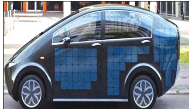
လူလေးယောက်စီး ကိုယ်ပိုင်ယာဉ် သို့မဟုတ် တက်စီအဖြစ် သုံးနိုင်သည့် ဆိုလာစနစ်သုံး EV ယာဉ် နမူနာပုံများ။