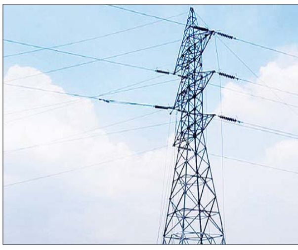
၁၃၂ ကေစီ ဘီလူးချောင်း(၂) - တီကျစ် ဓာတ်အားလိုင်း ပြန်လည် ပြုပြင်ပြီးစီးမှုကို တွေ့ရစဉ်။