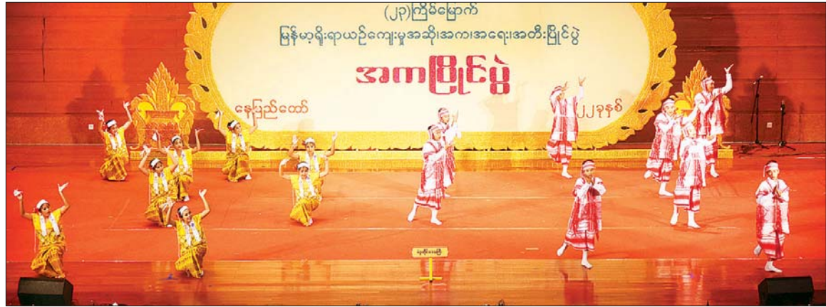
တိုင်းရင်းသားရိုးရာအကပြိုင်ပွဲတွင် ပဲခူးတိုင်းဒေသကြီးမှ ကရင်တိုင်းရင်းသားရိုးရာအကအဖွဲ့ ပါဝင်ယှဉ်ပြိုင်စဉ်။

တိုင်းရင်းသားပြည်သူများ၏ ဇာတိ သွေး၊ ဇာတိမာန်မြင့်မားရေး၊ အမျိုးသား ယဉ်ကျေးမှု ထိန်းသိမ်းစောင့်ရှောက် မြှင့်တင်ရေး၊ အမျိုးသားရေးစိတ်ဓာတ်၊ တိုင်းရင်းသား စည်းလုံးညီညွတ်ရေး စိတ်ဓာတ်နှင့် ပြည်ထောင်စုစိတ်ဓာတ် ရင့်သန်ခိုင်မာ ထွန်းကားပြန့်ပွားရေး အတွက် စာပေ၊ အနုပညာ၊ ယဉ်ကျေးမှု စွမ်းအားတို့ဖြင့် စေ့ဆော်စည်းရုံး မြှင့်တင် ပေးကြရမည်ဖြစ်ပြီး ပြည်သူများ၏ စိတ်ဓာတ်ရေးရာ အခြေခံတွင် မျိုးချစ် စိတ်ဓာတ်၊ တိုင်းရင်းသား စည်းလုံးညီညွတ် ရေး စိတ်ဓာတ်နှင့် ပြည်ထောင်စု စိတ်ဓာတ်များ ထာဝစဉ်ရှင်သန်ထက် မြတ်ပြီး ရင့်သန်ခိုင်မာနေစေအောင် မြန်မာ့ရိုးရာယဉ်ကျေးမှု အဆို၊ အက၊ အရေး၊ အတီး ပြိုင်ပွဲများမှ တစ်ဆင့် ပညာ ပေးစေဆော် စည်းရုံးဆောင်ရွက်လျက်ရှိ ကြောင်း သိရသည်။ သတင်းစဉ်