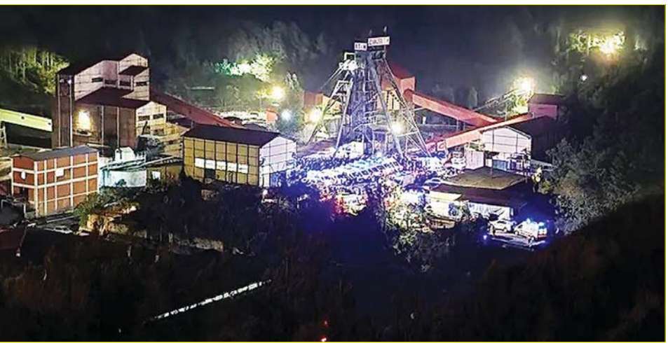
အမစ်ရာမြို့ သတ္တုတွင်းဝင်ပေါက်မြင်ကွင်းကို တွေ့ရစဉ်။