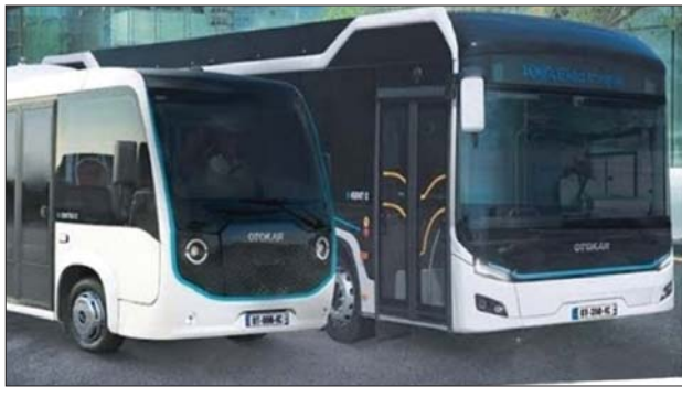
ပြည်သူများအား သယ်ယူပို့ဆောင်ရေးတွင် အသုံးပြုနိုင်သော EV Bus နှင့် ဆိုလာစနစ်သုံး EV Bus နမူနာပုံများ။

Solar Power Systems များတွင် ယနေ့ခေတ်မီ အသုံးပြုလာနိုင်နေကြသော Thin Flexible Multi- ple Wafer Solar Sheet များကို နည်းပညာ ကျွမ်းကျင်စွာအသုံးပြု ထုတ်လုပ်နိုင်မည့် ခင်မင်ရင်းနှီး သော အိန္ဒိယနိုင်ငံ၊ တရုတ်နိုင်ငံတို့နှင့် နှစ်နိုင်ငံအကျိုး တူ ပူးပေါင်းပြီး မိမိတိုင်းပြည်အတွင်းထုတ်လုပ်၍ ပြည်တွင်း ပြည်ပ ရောင်းချဖြန့်ဖြူးပေးနိုင်အောင် လည်း ဖော်ဆောင်ပေးသင့်သောကာလ ဖြစ်ပါသည်။ (ဆက်လက်ဖော်ပြပါမည်)