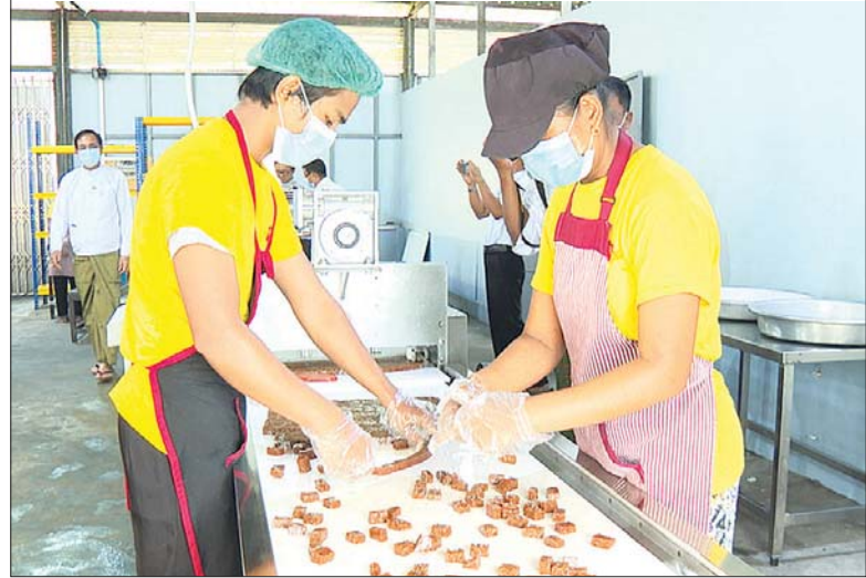
ပုသိမ်မြို့ ရွှေမြင်းပျံ ဟာလဝါ မုန့်စက်ရုံ၌ ဟာလဝါမုန့် ထုတ်လုပ်မှုကို တွေ့ရစဉ်။

စိုက်ပျိုးထုတ်လုပ်ရေးကို အခြေခံသည့် စက်မှု လုပ်ငန်းများကို အားပေးဆောင်ရွက်လျက်ရှိပါကြောင်း၊ ယခုအခါ ပုသိမ်စက်မှုမြို့တော်စီမံကိန်းနေရာမှ ပြည်ပသို့ တိုက်ရိုက်ဆန်တင်ပို့နိုင်မည်ဖြစ်သဖြင့် ကုန်ကျစရိတ်သက်သာပြီး အကျိုးအမြတ် ပိုမိုရရှိမည် ဖြစ်၍ များများတင်ပို့နိုင်ရေး ဝိုင်းဝန်းနည်းလမ်းရှာ ဆောင်ရွက်ကြရန်ဖြစ်ကြောင်း ပြောကြားသည်။ ဆက်လက်၍ Vent Dest Pathein Co.,Ltd အထည်ချုပ်စက်ရုံသို့ သွားရောက်ကြရာ တာဝန်ရှိသူ များက အထည်ချုပ်လုပ်ငန်း ဆောင်ရွက်မှုလုပ်ငန်းစဉ် ကို လိုက်လံရှင်းလင်းပြသကြသည်။ အဆိုပါ စက်ရုံ တွင် ပတ်ဝန်းကျင်ဒေသမှ လုပ်သားအင်အား ၈၀၀