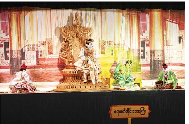
ပြည်ထောင်စုအဆင့်ပုဂ္ဂိုလ်များနှင့် တာဝန်ရှိသူများ ငါးပါးအကွရာ ရုပ်စုံသဘင်အဖွဲ့လိုက်ပြိုင်ပွဲတွင် ဧရာဝတီတိုင်းဒေသကြီးမှ ကပြယုတ်ပြိုင်မှုကို ကြည့်ရှုအားပေးစဉ်။

တွင် ဧရာဝတီတိုင်းဒေသကြီးမှ မမြဖူးပွင့် အကအဖွဲ့၊ မကွေးတိုင်းဒေသကြီးမှ မပြုံးပြုံးရီ အကအဖွဲ့၊ မန္တလေးတိုင်းဒေသကြီးမှ ရွှေမန်းမြေကျေးလက်ယိမ်းအဖွဲ့၊ ရခိုင်ပြည်နယ်မှ ရခိုင်ရိုးရာ မယိမ်တက် ယိမ်းအဖွဲ့၊ ကချင်ပြည်နယ်မှ လာချိဒ်ရိုးရာ အကအဖွဲ့၊ ရှမ်းပြည်နယ်မှ ပအိုဝ်းတိုင်းရင်းသားရိုးရာ အကအဖွဲ့၊ ကယားပြည်နယ်မှ ကယားတိုင်းရင်းသားရိုးရာ အကအဖွဲ့၊ တနင်္သာရီတိုင်းဒေသကြီးမှ ထားဝယ်တိုင်းရင်းသားရိုးရာယဉ်ကျေးမှု အကအဖွဲ့၊ မွန်ပြည်နယ်မှ မွန်ရိုးရာ (၁၂) မျိုး ယိမ်းအဖွဲ့၊ ကရင်ပြည်နယ်မှ ကရင်ရိုးရာ ဒုံးယိမ်းအဖွဲ့၊