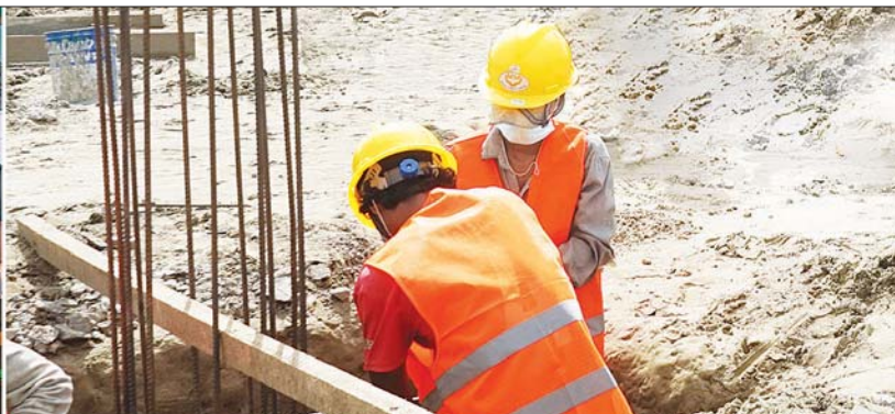
ပြည်ထောင်စုဝန်ကြီး ဦးမောင်မောင်အုန်း၊ တိုင်းဒေသကြီးဝန်ကြီးချုပ် ဦးတင်မောင်ဝင်းနှင့် တာဝန်ရှိသူများ ဧရာဝတီတိုင်းဒေသကြီး ပန်းတနော်မြို့နယ် လူထုအခြေပြုဗဟိုဌာနဆောက်လုပ်မှုကို ကြည့်ရှုစစ်ဆေးစဉ်။

မြို့နယ် ပြန်/ဆက်ရုံးများကို နိုင်ငံတော်ဘဏ္ဍာငွေ ခွင့်ပြုမှုနှင့် အကျိုးတူပူးပေါင်းဆောင်ရွက်မှုတို့ဖြင့် လူထုအခြေပြုဗဟိုဌာနများအဖြစ် ပြောင်းလဲဆောင် ရွက်လျက်ရှိရာ ယခုအခါ ပန်းတနော်မြို့နယ် လူထု အခြေပြုဗဟိုဌာနကို အရွယ်အစား ပေ (၁၀၀ x ၆၀) RC နှစ်ထပ်အဆောက်အအုံအဖြစ် နိုင်ငံတော်ဘဏ္ဍာ ငွေမှ ငွေကျပ်သန်း (၅၅၂ ဒသမ ၆) သန်း အသုံးပြု၍ ၂၀၂၃ ခုနှစ် မတ်လအပြီး ဆောက်လုပ်နေခြင်းဖြစ်သည်။ ထို့နောက် ပြည်ထောင်စုဝန်ကြီးနှင့် တိုင်းဒေသ ကြီး ဝန်ကြီးချုပ်တို့သည် ကျောင်းကုန်းမြို့နယ် ဧရာဝတီအုပ်စုရှိ ၂၀၂၂-၂၀၂၃ ခုနှစ် မျိုးစေ့ထုတ် တောင်သူများ၏ ဆင်းသုခစပါးစီးပွားဖြစ် မျိုးသန့် မျိုးစေ့ထုတ် ဧက ၅၀ စံပြစိုက်ခင်း၏စံကွက်ရိတ်သိမ်း ပွဲသို့ ရောက်ရှိကြရာ တိုင်းဒေသကြီး စိုက်ပျိုးရေး ဦးစီးဌာန ဦးစိန်မောင်မြင့်က မြို့နယ်၊ ခရိုင်၊ တိုင်းဒေသ ကြီးအလိုက် စပါးမျိုးစေ့ထုတ်လုပ်နိုင်မှုနှင့် သစ်စိမ်း မြေဩဇာထည့်သွင်းနိုင်မှု အခြေအနေများကို ရှင်းလင်းတင်ပြပြီး ရိတ်သိမ်းခြွေလှေ့စက်ဖြင့် စံကွက်ရိတ်သိမ်းမှုကို ရှင်းလင်းတင်ပြသည်။ ဆက်လက်၍ ပြည်ထောင်စုဝန်ကြီးနှင့် တိုင်းဒေသကြီး ဝန်ကြီးချုပ်တို့သည် စံကွက် ရိတ်သိမ်းပွဲသို့ တက်ရောက်လာကြသည့် တောင်သူ များအား ရင်းရင်းနှီးနှီး တွေ့ဆုံနှုတ်ဆက်ပြီး မိရိုး ဖလာ စမ်းသပ်စိုက်ပျိုးမှုမှ ပြောင်းလဲလာသော ခေတ်နှင့်အညီ စနစ်တကျ စီးပွားဖြစ်စိုက်ပျိုး ထုတ်လုပ်နိုင်ရေး၊ အထွက်နှုန်းကောင်းသည့် မျိုးသန့်