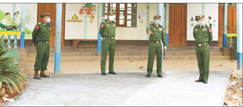
ကွန်ကရစ် လူသွားလမ်း ဖောက်လုပ် ပြီးစီးမှုကို ကြည့်ရှု စစ်ဆေးစဉ်။

နေပြည်တော် အောက်တိုဘာ ၁၅ ကြိုက်ဒေသတိုင်းစစ်ဌာနချုပ်နှင့် စေတနာရှင်အလှူရှင်များမှ စုပေါင်းလှူဒါန်းသော ရှမ်းပြည်နယ်(အရှေ့ပိုင်း) ကျိုင်းတုံမြို့ရှိ အမှတ်(၅)အခြေခံပညာ အထက်တန်းကျောင်းအတွင်း၌ ကွန်ကရစ်လူသွားလမ်း ဖောက်လုပ် ပြီးစီးမှုအခြေအနေများကို ယနေ့နံနက်ပိုင်းတွင် တိုင်းမှူး ဗိုလ်ချုပ် နီလင်းအောင်နှင့် အဖွဲ့ဝင်များက သွားရောက်ကြည့်ရှုပြီး လိုအပ်သည်များ ညှိနှိုင်းဆောင်ရွက်ပေးခဲ့ကြောင်း သတင်းရရှိသည်။ သတင်းစဉ်