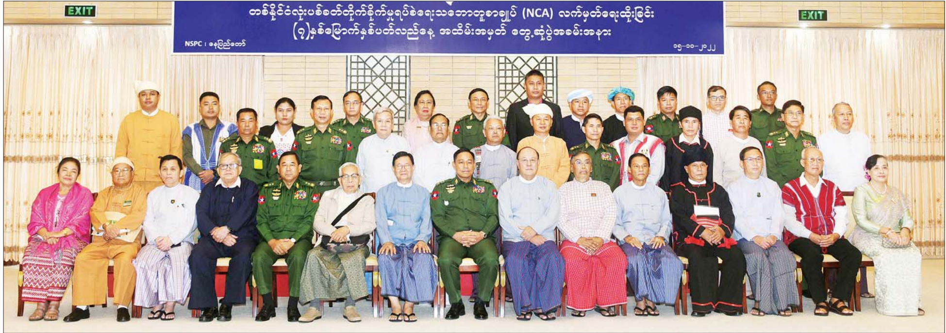
အမျိုးသားစည်းလုံးညီညွတ်ရေးနှင့် ငြိမ်းချမ်းရေးဖော်ဆောင်မှု ညှိနှိုင်းရေးကော်မတီဥက္ကဋ္ဌ ဒုတိယဗိုလ်ချုပ်ကြီး ရာပြည့်နှင့် တက်ရောက်လာကြသူများ တစ်နိုင်ငံလုံးပစ်ခတ်တိုက်ခိုက်မှုရပ်စဲရေး သဘောတူစာချုပ် (NCA) လက်မှတ်ရေးထိုးခြင်း (၇)နှစ်မြောက် နှစ်ပတ်လည်နေ့ တွေ့ဆုံပွဲအခမ်းအနားတွင် စုပေါင်းမှတ်တမ်းတင်ဓာတ်ပုံရိုက်စဉ်။

အဖွဲ့ဝင်များဖြစ်ကြသည့် နယ်စပ်ရေးရာဝန်ကြီးဌာန ပြည်ထောင်စုဝန်ကြီး ဒုတိယဗိုလ်ချုပ်ကြီး ထွန်းထွန်းနောင်၊ သယံဇာတနှင့် သဘာဝပတ်ဝန်းကျင် ထိန်းသိမ်းရေးဝန်ကြီးဌာန ပြည်ထောင်စုဝန်ကြီး ဦးခင်မောင်ရီ၊ လူဝင်မှုကြီးကြပ်ရေးနှင့် ပြည်သူ့အင်အားဝန်ကြီးဌာန ပြည်ထောင်စုဝန်ကြီး ဦးမြင့်ကြိုင်နှင့် ယခင် MPC အကြီးတန်းအကြံပေး ဦးလှမောင်ရွှေ၊ ပြည်ထောင်စုအဆင့် ပစ်ခတ်တိုက်ခိုက်မှုရပ်စဲရေးဆိုင်ရာ ပူးတွဲစောင့်ကြည့်ရေးကော်မတီ (JMC-U) အဖွဲ့ဝင်များ ဖြစ်ကြသည့် ဦးပြည့်စုံ၊ ဦးမောင်မောင်ငြိမ်းနှင့် စိုင်းမျိုးသန့်တို့က NCA အထိမ်းအမှတ်စကားများ ပြောကြားကြသည်။ ဆက်လက်၍ ငြိမ်းချမ်းရေးလုပ်ငန်းစဉ်အစမှ NCA စာချုပ်ဖြစ်ပေါ်လာသည်အထိ ကိုယ်တိုင် ပါဝင် ကြိုးပမ်းဆောင်ရွက်မှုအတွက် ဂုဏ်ပြုထိုက်သည့် ပုဂ္ဂိုလ်များ၊ တိုင်းရင်းသားလက်နက်ကိုင်အဖွဲ့အစည်း ခေါင်းဆောင်များအား NCA (၇) နှစ်မြောက် နှစ်ပတ်လည်နေ့ ဂုဏ်ပြုလက်ဆောင်များကို ပေးအပ်ချီးမြှင့်ပြီး အခမ်းအနားကို အောင်မြင်စွာ ရပ်သိမ်းလိုက်သည်။ ထို့နောက် မှတ်တမ်းတင်ဓာတ်ပုံရိုက်ပြီး ဂုဏ်ပြုနေ့လယ်စာဖြင့် တည်ခင်းညှိနှိုင်းပွဲအပြီး သိရသည်။ သတင်းစဉ်