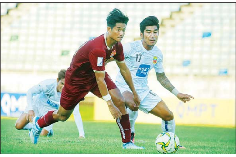
ဧရာဝတီအသင်းနှင့် ရှမ်းယူနိုက်တက်အသင်း ယှဉ်ပြိုင်နေစဉ်။

ရန်ကုန် အောက်တိုဘာ ၁၅ ၂၀၂၂ ရာသီ MNL အမှတ်ပေးပြိုင်ပွဲ ပွဲစဉ် (၁၆) ပထမနေ့အဖြစ် ဧရာဝတီအသင်းနှင့် ရှမ်းယူနိုက်တက်အသင်းတို့အောက်တိုဘာ ၁၅ ရက်က ရန်ကုန်မြို့ရှိ သုဝဏ္ဏကွင်း၌ ယှဉ်ပြိုင်ကစားရာ ရှမ်းယူနိုက်တက် အသင်းက နှစ်ဂိုး-တစ်ဂိုးဖြင့် အနိုင်ရခဲ့သည်။ လက်ရှိချန်ပီယံ ရှမ်းယူနိုက်တက် အသင်းသည် သုံးရာသီဆက် ချန်ပီယံ အိပ်မက်အတွက် အမှားအယွင်းမရှိ ဆက်လက်ဦးဆောင်နေပြီး ယခုပွဲတွင် လည်း ဧရာဝတီကို အနိုင်ယူကာ ၁၄ ပွဲ စာမျက်နှာ ၂၄ ကော်လံ ၅ ■