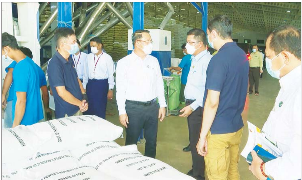
ပြည်ထောင်စုဝန်ကြီး ဦးမောင်မောင်အုန်း၊ တိုင်းဒေသကြီးဝန်ကြီးချုပ် ဦးတင်မောင်ဝင်းနှင့် တာဝန်ရှိသူများ ဧရာဝတီတိုင်းဒေသကြီး ကြည့်ရှုလေ့လာစဉ်။

စပါးများအသုံးပြုပြီး သဘာဝဓာတ်မြေဩဇာ သွင်းအားစုများ စနစ်တကျအသုံးပြုရေးတို့ကို ရှင်းလင်းပြောကြားပြီး ကျယ်ကျယ်ပြန့်ပြန့် အသိပညာပေးနိုင်ရန်နှင့် လိုအပ်ချက်များ ဖြည့်ဆည်းပေးနိုင်ရန် ညှိနှိုင်းပေးပေးဆောင်ရွက်ပေးသည်။ ဧရာဝတီတိုင်းဒေသကြီး ကျောင်းကုန်းမြို့နယ် တွင် ရပ်ကွက်တစ်ခုနှင့် ကျေးရွာအုပ်စုပေါင်း ၆၅ စုမှ တောင်သူ ၂၆၀၃၉ ဦးတို့က မိုးစပါး ၁၁၈၀၆ ဧက စိုက်ပျိုးထားရှိမှုအနက် ကျေးရွာအုပ်စုပေါင်း ၂၄ ခုမှ တောင်သူ ၉၅ ဦးတို့က ဆင်းသုခမျိုးသန့်စပါး (၉၅၇ ဒသမ ၅)ဧက စိုက်ပျိုးထုတ်လုပ်နိုင်မှုနှင့်အတူ ကျေးရွာအုပ်စု ၁၁ စုမှ တောင်သူ ၁၇၆ ဦးတို့က သစ်စိမ်းမြေဩဇာ (ပိုက်ဆံလျှော်) ဧက ၁၀၀၀ ထည့်သွင်းစိုက်ပျိုးလျက်ရှိကြောင်းနှင့် ယင်းစံကွက် ရိတ်သိမ်းမှုမှာ တစ်ဧကလျှင် စပါး(အခြောက်) ပျမ်းမျှ အထွက်နှုန်း ၁၁၅ တင်းဖြစ်ကြောင်း သိရသည်။ မွန်းလွဲပိုင်းတွင် ပုသိမ်စက်မှုမြို့တော်စီမံကိန်း ရှင်းလင်းဆောင်၌ စီမံကိန်းဒုတိယဥက္ကဋ္ဌ ဦးစိုးသူရက စီမံကိန်းလျာထားမှုနှင့် တိုးတက်ပြီးစီးမှု အခြေအနေ ဆက်လက် ဆောင်ရွက်မည့်လုပ်ငန်းစဉ်များ၊ ကူညီပံ့ပိုးပေးစေလိုသည့် အချက်များကို ရှင်းလင်းတင်ပြရာ ပြည်ထောင်စုဝန်ကြီးက အသေးစား၊ အငယ်စားနှင့် အလတ်စား စက်မှုလုပ်ငန်း (MSME) များသည် မိမိဒေသတစ်ခုအတွက်