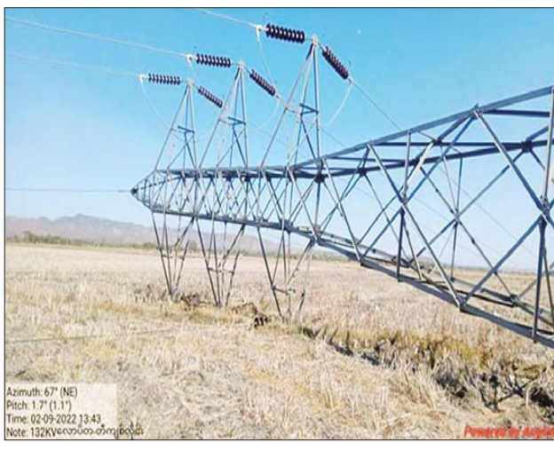
၁၃၂ ကေစီ ဘီလူးချောင်း(၂) - တီကျစ် ဓာတ်အားလိုင်း ဖျက်ဆီး ထားရှိမှုကို တွေ့ရစဉ်။

CRPH နှင့် NUG တို့၏ လက်ဝေခံ PDF အမည်ခံ အကြမ်းဖက်သမားများက ဒေသတွင်း ဖွံ့ဖြိုးတိုးတက်ရေးအတွက် အခြေခံကျသော လှုပ်ရှားစစ်တပ်အားလှိုင်းများ ၏ တာဝါတိုင်များကို မိုင်းထောင်ဖောက်ခွဲ၊ မီးရှို့ဖျက်ဆီးခဲ့သဖြင့် ပြန်လည်ပြုပြင် ဆောင်ရွက်ထားရှိမှု အခြေအနေ