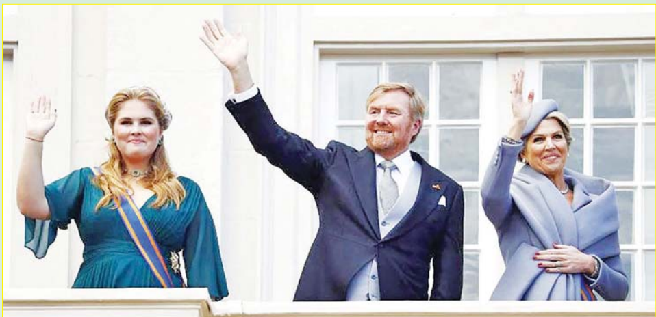
အိမ်ရှေ့မင်းသမီး ကက်သရီနာ အိမ်မလီယာကို နယ်သာလန်ဘုရင်မိဖုရားတို့နှင့် အတူတွေ့ရစဉ်။

ဘုရင်နှင့်မိဖုရားတို့၏ ထုတ်ပြန်ချက်ပြီးနောက် ယင်းကိစ္စနှင့် ပတ်သက်၍ ရဲများနှင့်အစိုးရရှေ့နေ များက နောက်ထပ်ထုတ်ပြန်ချက်များ ထုတ်ပြန်ခဲ့ ခြင်းမရှိပေ။ ဘုရင်နှင့်မိဖုရားတို့ကမူ အိမ်ရှေ့မင်း သမီးကြုံတွေ့ရသည့်ခြိမ်းခြောက်မှုမှာ ပြင်းထန်ပြီး ၎င်း၏ ဘဝတွင်သက်ရောက်မှုများ ရှိလာမည်ဟု သိရှိထားကြသည်။ အိမ်ရှေ့မင်းသမီးလုံခြုံစိတ်ချရ ရေးအတွက် လူတိုင်းလူတိုင်း အစွမ်းကုန်ကြိုးပမ်း နေကြသည်ဟု အာမခံကြောင်း တရားရေးနှင့် လုံခြုံရေးဝန်ကြီး ဒိုင်လင်းယက်စ်ဆိုဂုစ်က ပြော သည်။