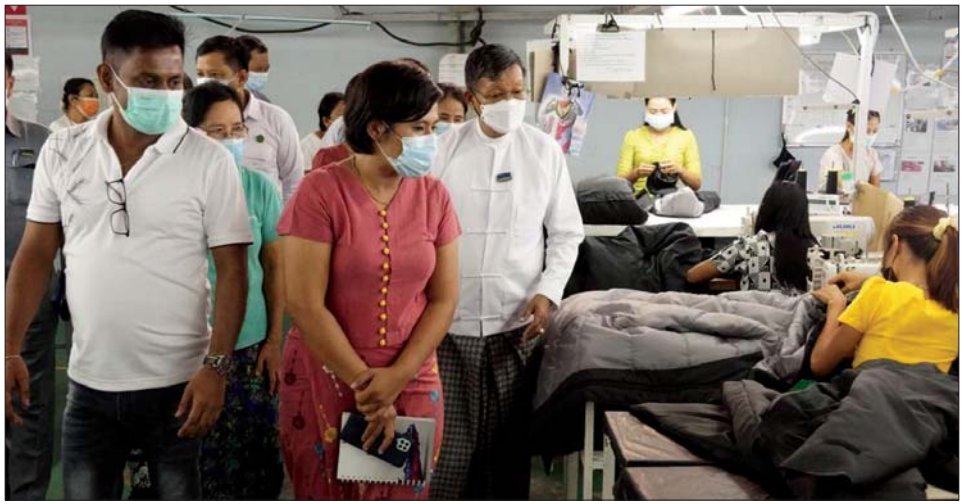
ထား ဆောင်ရွက်ရန်တို့ကို လုပ်ငန်းများနှင့်အညီ ကူညီ အတွင်း လုပ်ငန်းဆောင်ရွက်မှုများ မှာကြား၍ ရင်းနှီးမြှုပ်နှံမှု လွယ်ကူ ပံ့ပိုးဆောင်ရွက်ပေးမည့် အခြေ ကို လှည့်လည်ကြည့်ရှု အားပေး ချောမွေ့စေရေးအတွက် လုပ်ထုံး အနေများကို ဆွေးနွေးပြီး စက်ရုံ ခဲ့သည်။ မြို့နယ် (ပြန်/ဆက်)

မြန်မာနိုင်ငံရင်းနှီးမြှုပ်နှံမှုကော်မရှင်၏ ခွင့်ပြုမိန့်ဖြင့် ဒက္ကဏသီရိမြို့နယ်အတွင်း၌ ရာခိုင်နှုန်းပြည့်မြန်မာ နိုင်ငံသားရင်းနှီးမြှုပ်နှံမှုဖြင့် CMP စနစ်ဖြင့် အထည်ချုပ်လုပ်ငန်း ဆောင်ရွက်လျက်ရှိသော Chindwin Banner ကုမ္ပဏီလီမိတက်၏ လုပ်ငန်းဆောင်ရွက်မှု အခြေအနေများကို နေပြည်တော်ကောင်စီ ဥက္ကဋ္ဌ ဦးတင်ဦးလွင်သည် ကောင်စီအဖွဲ့ဝင် ဦးဇေယျာလင်း၊ နေပြည်တော်စည်ပင်သာယာရေးကော်မတီမှ ဒုတိယ မြို့တော်ဝန် ဦးမောင်မောင်နှင့် ဌာနဆိုင်ရာတာဝန်ရှိသူများနှင့်အတူ အောက်တိုဘာ ၁၄ ရက်တွင် သွားရောက် ကြည့်ရှုခဲ့သည်။