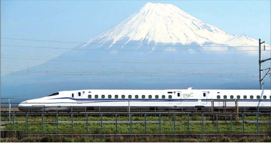
ဂျပန်နိုင်ငံ၏ အထင်ကရပြယုဂ် နှစ်ခုဖြစ်သည့် ဖူဂျီတောင်နှင့် ရှင်ကန်ဆန်အမြန်ရထား။

ဂျပန်နိုင်ငံရဲ့ မီးရထားအကြောင်းပြောကြရင် ရှင်ကန်ဆန်လိုခေါ်ကြတဲ့ အမြန်ရထားပြေးဆွဲမှု ကလည်း အဓိကအခန်းကဏ္ဍကနေ ပါဝင်နေပါတယ်။ ရှင်ကန်ဆန်အမြန်ရထားတွေဟာ ဂျပန်နိုင်ငံရဲ့ ရထားသမိုင်းမှာ ကြီးမားတဲ့အပြောင်းအလဲ တွေကို ဖော်ဆောင်ပေးနိုင်ခဲ့တာ ဖြစ်ပါတယ်။ စိတ်ဝင်စားစရာအချက်က ဒီအမြန်ရထားတွေ တည်ဆောက်ဖို့ စတင်ကြံစည်ခဲ့တဲ့အချိန်က ဂျပန်နိုင်ငံဟာ နယ်မြေသစ်တွေ ချဲ့ထွင်နေတဲ့ ၁၉၃၉ ခုနှစ်မှာ ဖြစ်ပါတယ်။ မူလအစီအစဉ်အရ တစ်နာရီကို ကီလိုမီတာ ၂၀၀ အထိ မောင်းနှင်နိုင် မယ့် ရထားလမ်းကို ဂျပန်နိုင်ငံ၊ ဟွန်ရှူးကျွန်းကနေ အာရှတိုက်ကမ်းခြေအထိ ကိုရီးယားကျွန်းဆွယ် ကနေတစ်ဆင့် ပင်လယ်ရေအောက်လမ်းကြောင်း ကနေ ပြေးဆွဲဖို့ ရည်ရွယ်ခဲ့တယ်လို့ သိရပါတယ်။ အာရှကမ်းခြေအထိရထားပြေးဆွဲဖို့ အစီအစဉ်ကို ဂျပန်နိုင်ငံဟာ ၁၉၄၄ ခုနှစ်မှာ စွန့်လွှတ်ခဲ့ပေမယ့် ပြည်တွင်းမှာ ပြေးဆွဲနိုင်ဖို့အတွက် Japan National Railways (JNR) ကုမ္ပဏီက ဂျပန်နိုင်ငံ သားအင်ဂျင်နီယာ Hideo Shima က ဆက်လက် ဆောင်ရွက်ခဲ့ပါတယ်။