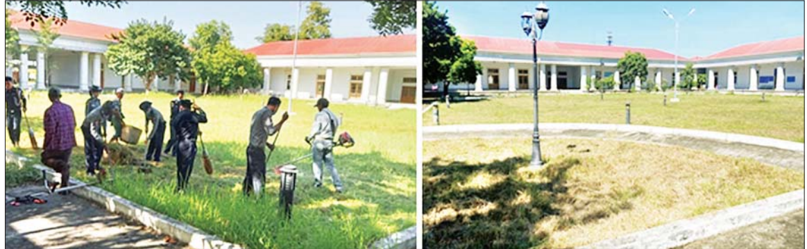
နေပြည်တော်ကောင်စီနယ်မြေ ဒက္ခိဏသီရိမြို့နယ် စုပေါင်းရုံးရှေ့၌ သန့်ရှင်းရေးဆောင်ရွက်စဉ် (ဝဲပုံ)နှင့် ဆောင်ရွက်ပြီး (ယာပုံ) တွေ့ရစဉ်။

● ကျောပုံးမှ ခရိုင်မီးသတ်ရုံးကို CDF အမည်ခံ အကြမ်း ဖက်သမားများက လက်နက်ကြီး၊ လက်နက် ငယ်များဖြင့် အကြောင်းမဲ့လာရောက်ပစ်ခတ် တိုက်ခိုက်ပြီး မော်တော်ယာဉ်များ မီးရှို့ခဲ့သဖြင့် အဆိုပါအနီးတစ်ဝိုက် လုံခြုံရေးဆောင်ရွက် နေသော တပ်ဖွဲ့ဝင်များက ပြန်လည်ပစ်ခတ်