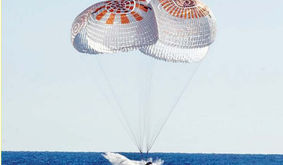
အာကာသယာဉ်မှူးလေးဦးကို သယ်ဆောင်လာသည့် အာကာသယာဉ်အခန်းငယ် ဖလော်ရီဒါပြည်နယ် အတ္တလန္တိတ်သမုဒ္ဒရာအတွင်း ဆင်းသက်လာသည်ကို တွေ့ရစဉ်။