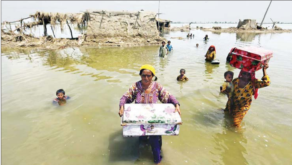
ပါကစ္စတန်နိုင်ငံအတွင်း ရေကြီးနှစ်မြုပ်နေသည့် မြင်ကွင်းတစ်ခုကို တွေ့ရစဉ်။

အစ္စလာမာဘတ်အောက်တိုဘာ ၇ ပါကစ္စတန်နိုင်ငံ၌ ဇွန်လလယ်မှ စကာ မုတ်သုံမိုးရာသီအတွင်း ရေကြီးမှုကြောင့် သေဆုံးသူ ၁၇၀၀ အထိတိုးလာပြီး ဒဏ်ရာ ရရှိသူ ၁၂၈၆၇ ဦး ရှိကြောင်း အမျိုးသားသဘာဝဘေးအန္တရာယ် စီမံခန့်ခွဲမှု အာဏာပိုင်အဖွဲ့ (အင်န်ဒီအမ်အေ)က အောက်တို ဘာ ၆ ရက် ညပိုင်းက ပြောကြား သည်။