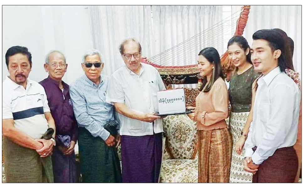
မြန်မာနိုင်ငံရုပ်ရှင်အစည်းအရုံးကကျင်းပပြုလုပ်မည့် (၄၅) ကြိမ်မြောက် ရုပ်ရှင်သက်ကြီးပူဇော်ပွဲအတွက် အောက်တိုဘာ ၆ ရက်တွင် Forever Group ( MRTV - 4 ) မိသားစုများက အလှူငွေ ၇၃ သိန်း ၅ သောင်း ပေးအပ်လှူဒါန်းရာ မြန်မာနိုင်ငံရုပ်ရှင်အစည်းအရုံး နာယကများက လက်ခံရယူစဉ်။ သတင်းစဉ်

နိုင်ငံတစ်ဝန်း စိမ်းလန်းဖို့ သစ်ပင်စိုက်ပျိုး ထိန်းသိမ်းဖို့။