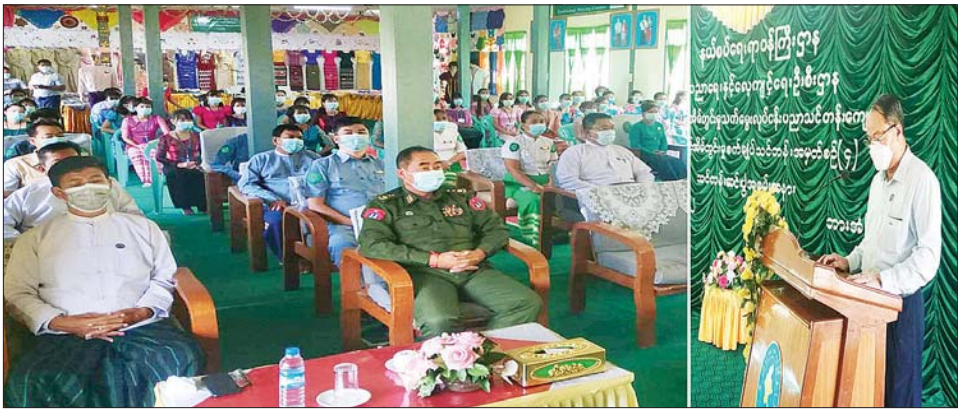
ကရင်ပြည်နယ်ဝန်ကြီးချုပ် ဦးစောမြင့်ဦး အမျိုးသမီးအိမ်တွင်းမှု သက်မွေးလုပ်ငန်းပညာသင်တန်းကျောင်း ဘားအံသင်တန်းဆင်းပွဲအခမ်းအနားတွင် အမှာစကားပြောကြားစဉ်။

နေပြည်တော် အောက်တိုဘာ ၇ - နယ်စပ်ရေးရာဝန်ကြီးဌာန ပညာရေးနှင့် လေ့ကျင့်ရေးဦးစီးဌာန ကွပ်ကဲမှုအောက်ရှိ အမျိုးသမီးအိမ်တွင်းမှု သက်မွေးလုပ်ငန်းပညာသင်တန်းကျောင်း ၂၄ ကျောင်းတို့၌ အဆင့်မြင့်အိမ်တွင်းမှု စက်ချုပ်သင်တန်းဆင်းပွဲကို ယနေ့နံနက်ပိုင်းတွင် ကျင်းပရာ မုဒုံမြို့ သင်တန်းကျောင်းတွင် မွန်ပြည်နယ်ဝန်ကြီးချုပ် ဦးဇော်လင်းထွန်း၊ ဘားအံမြို့ သင်တန်းကျောင်းတွင် ကရင်ပြည်နယ်ဝန်ကြီးချုပ် ဦးစောမြင့်ဦး၊ ပုသိမ်မြို့ သင်တန်းကျောင်းတွင် ဧရာဝတီတိုင်းဒေသကြီး ဝန်ကြီးချုပ် ဦးတင်မောင်ဝင်း၊ ကျိုင်းတုံမြို့ သင်တန်းကျောင်းတွင် ကြိတ်ဒေသတိုင်းစစ်ဌာနချုပ် တိုင်းမှူး