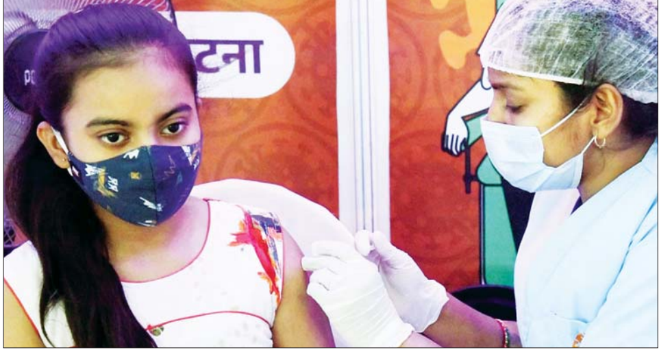
အိန္ဒိယနိုင်ငံ၌ ကိုဗစ်-၁၉ ကာကွယ်ဆေးထိုးပေးနေသည်ကို တွေ့ရစဉ်။

အိန္ဒိယနိုင်ငံ၌ လွန်ခဲ့သော ၂၄ နာရီအတွင်း ကိုဗစ်-၁၉ ကြောင့် သေဆုံးသူ ကိုးဦးရှိသဖြင့် ကပ်ရောဂါ စတင်ဖြစ်ပွားသည့် အချိန်မှစကာ သေဆုံးသူပေါင်း ၅၂၈၇၅၄ ဦးရှိကြောင်း ဝန်ကြီး ဌာနက ပြောကြားသည်။ ဆင်ဟွာ