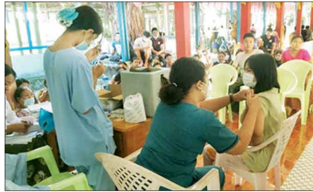
ပူးပေါင်း၍ ကိုဗစ်-၁၉ ရောဂါ လှုံ့ဆော်ခြင်းနှင့် နှာခေါင်းစည်း ကာကွယ်ရေးအတွက် အသိပညာ များအား ဒေသခံပြည်သူများ ပေးဆောင်ရွက်ခြင်း၊ နှာခေါင်းစည်း လက်ဝယ်အရောက် အခမဲ့ပေးဝေ များတပ်ဆင်ပြီး သွားလာကြရန် လျှို့ဝှက်လျက်ရှိပါသည်။ သတင်းစဉ်

မြို့နယ်၊ မန္တလေးတိုင်း ဒေသကြီး မဟာအောင်မြေမြို့နယ် အပါ အဝင် မြို့နယ် ငါးမြို့နယ်တို့ရှိ စာသင်ကျောင်းများ၊ ဈေးများ၊ လမ်းများ၊ မြို့အဝင်ဂိတ်များနှင့် လူစည်ကားရာ နေရာများတွင် နယ်မြေခံ တပ်မတော်သားများက ခရိုင်/မြို့နယ် စီမံအုပ်ချုပ်ရေး အဖွဲ့မှ တာဝန်ရှိသူများ၊ ဌာန ဆိုင်ရာ ဝန်ထမ်းများ၊ တာဝန်ရှိသူ များ၊ ပရဟိတအဖွဲ့များနှင့်