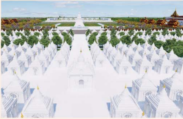
ကျောက်စာရုံစေတီ(၁၂ x ၁၂ x ၁၈)ပေ ၁ ဆူ တန်ဖိုး- ၂၇၉ သိန်း