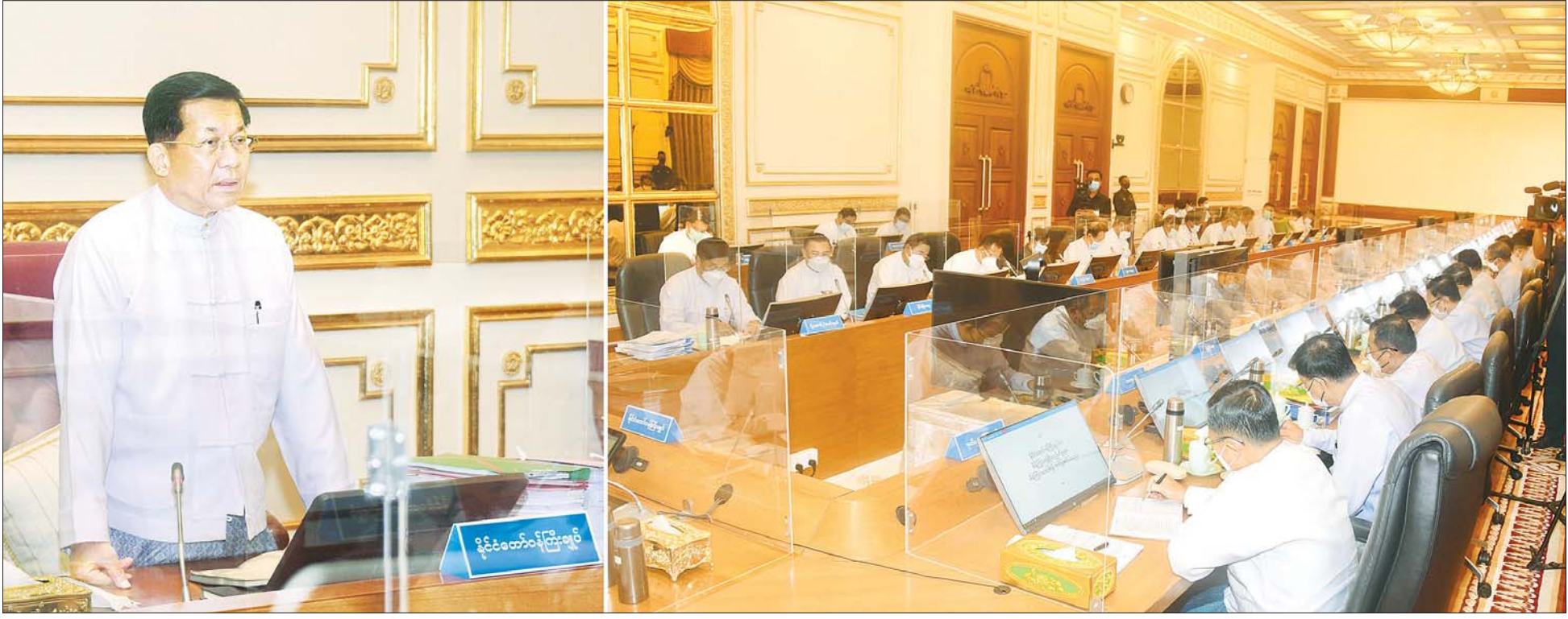
နိုင်ငံတော်စီမံအုပ်ချုပ်ရေးကောင်စီဥက္ကဋ္ဌ နိုင်ငံတော်ဝန်ကြီးချုပ် ဗိုလ်ချုပ်မှူးကြီး မင်းအောင်လှိုင် ပြည်ထောင်စုအစိုးရအဖွဲ့ အစည်းအဝေး အမှတ်စဉ် (၇/၂၀၂၂) တွင် အမှာစကားပြောကြားစဉ်။

MSME ဆောင်ရွက်နေသူများအနေဖြင့် ကိုယ်တိုင် ကြိုတင်အားထုတ်ဆောင်ရွက်ရန်လိုအပ်ပြီး ခိုင်မာသည့် လုပ်ငန်းများရှိချိန်တွင် နိုင်ငံတော်မှ ရင်းနှီးမြှုပ်နှံငွေများ ထုတ်ချေးပေးသွားမည်