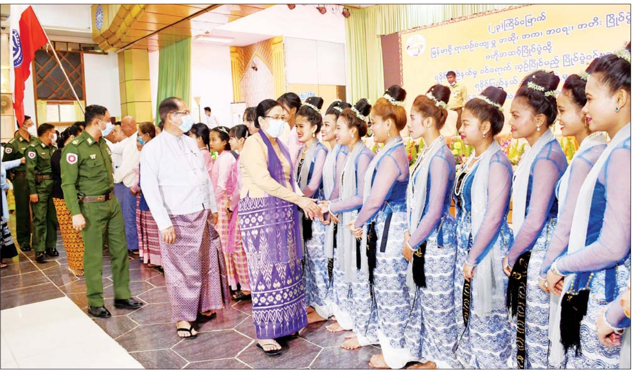
နိုင်ငံတော်စီမံအုပ်ချုပ်ရေးကောင်စီအဖွဲ့ဝင် ဒေါ်အေးနုစိန် မြန်မာ့ရိုးရာယှဉ်ပြိုင်ပွဲအဆို၊ အက၊ အရေး၊ အတီး ဗဟိုအဆင့်ပြိုင်ပွဲသို့ ရခိုင်ပြည်နယ်မှ ဝင်ရောက်ယှဉ်ပြိုင်မည့် ပြိုင်ပွဲဝင်များအား ရင်းရင်းနှီးနှီး နှုတ်ဆက်စဉ်။

အားလုံးကြိုးစား အားထုတ်ကြရန် တိုက်တွန်းပြောကြားလိုကြောင်း၊ ပြိုင်ပွဲဝင်များသည် ရခိုင်ပြည်နယ် အတွက် ကိုယ်စားပြုပြီး မြို့နယ် အသီးသီးမှ ဝင်ရောက်ယှဉ်ပြိုင်ကြ သူများဖြစ်သဖြင့် ညီအစ်ကို မောင်နှမသဖွယ် စည်းစည်းရုံးရုံး နေထိုင်ကြကာ အခက်အခဲရှိပါက လည်း တစ်ဦးနှင့်တစ်ဦး ဖေးမ ကူညီရိုင်းပင်း နေထိုင်သွားကြရန် မှာကြားလိုကြောင်း၊ နေပြည်တော် သို့ရောက်ရှိသည့်အခါ ကျန်းမာရေး ဂရုစိုက်ကြရန်၊ အထူးသဖြင့် ကိုဗစ်-၁၉ ရောဂါ ကာကွယ်ရေး ညွှန်ကြားချက်များနှင့်အညီ နေထိုင် သွားကြရန် မှာကြားလိုကြောင်း၊ ပြိုင်ပွဲကာလ တစ်လျှောက်တွင် လည်း ကျန်းမာရေးကို အထူးဂရု ပြု ဆောင်ရွက်ကြစေလိုကြောင်း၊ ရခိုင်ပြည်နယ်အတွက် ပြိုင်ပွဲဝင် များကို အနီးကပ် သင်ကြားပြသ ပေးခဲ့သည့် နည်းပြဆရာ၊ ဆရာမ များကိုလည်း ကျေးဇူးအထူး တင်ရှိပါကြောင်း၊ ရခိုင်ပြည်နယ်မှ (၂၂) ကြိမ်မြောက် အဆို၊ အက၊ အရေး၊ အတီးပြိုင်ပွဲတွင် တိုင်း ဒေသကြီး၊ ပြည်နယ်အဆင့်တွင် အဆင့်(၅) ရရှိခဲ့ပါကြောင်း၊ ယခု နှစ်တွင်လည်း ရခိုင်ပြည်နယ် အတွက် ရွတ်ဆိုပေး များစွာ ဆွတ်ခူးနိုင်ကြပြီး ရခိုင်သားဆို