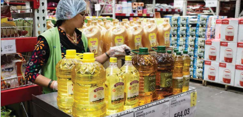
အိန္ဒိယနိုင်ငံ စတိုးဆိုင်တစ်ဆိုင်မှ ဆီအရောင်းကောင်တာတစ်ခု။

ကမ္ဘာ့စားသုံးဆီဈေးနှုန်းများ ကျဆင်းမှု နှင့် သွင်းကုန်အခွန်နှုန်းထား လျော့ချ ကောက်ခံခြင်းတို့ကြောင့် အိန္ဒိယနိုင်ငံ၌ စားသုံးဆီ လက်လီရောင်းချဈေးနှုန်းများ သိသာစွာကျဆင်းလာသည်ကို မြင်တွေ့ရပြီး စားအုန်းဆီကြမ်း၊ RBD Palmolein၊ RBD စားအုန်းဆီ၊ ပဲစိပ်ဆီကြမ်း၊ သန့်စင်ပြီး ပဲစိပ်ဆီ၊ နေကြာဆီကြမ်းနှင့် သန့်စင်ပြီး နေကြာဆီတို့အပေါ် လက်ရှိကောက်ခံလျက် ရှိသည့် အကောက်ခွန်နှုန်းထားများအတိုင်း