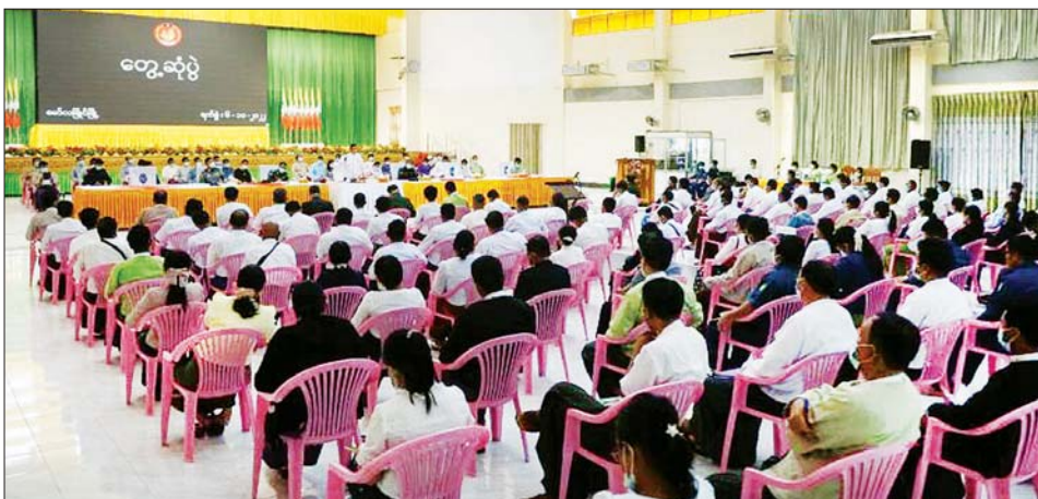
ကျေးရွာများ ဖွံ့ဖြိုးတိုးတက်လာ စေရေးကို နှစ်စဉ်စီမံကိန်းများ ချမှတ် အကောင်အထည်ဖော် ဆောင်ရွက်ပေးလျက်ရှိကြောင်း၊ ဒေသဖွံ့ဖြိုးရေး လုပ်ငန်းများ၊ ပညာရေးနှင့် ကျန်းမာရေးကဏ္ဍ များ ပိုမိုတိုးတက်လာစေရေး၊ ပြည်သူများ စားနပ်ရိက္ခာဖူလုံမှု ရှိစေရေးတို့ကို အထူးအလေးပေး ဆောင်ရွက်ကြရန် လိုအပ် ကြောင်း၊ ရပ်ကွက်၊ ကျေးရွာ အုပ်ချုပ်ရေးများများ အနေဖြင့် ရပ်ရွာ အေးချမ်းသာယာရေးနှင့် ပြည်သူ့အကျိုးပြု ဆောင်ရွက်ရေး

နေပြည်တော် အောက်တိုဘာ ၆ မွန်ပြည်နယ်အတွင်း စည်းကမ်း ရှိပြီး စနစ်ကျသည့် လူမှုပတ်ဝန်း ကျင်ဖော်ဆောင်၍ အဓိကကျ သည့် အုပ်ချုပ်ရေး၊ စီးပွားရေး၊ လူမှုရေး၊ ဒေသဖွံ့ဖြိုးရေးကိစ္စရပ် များကို ပူးပေါင်းပါဝင်ဆောင်ရွက် နိုင်ရန် ရည်ရွယ်၍ ပြည်နယ်၊ ခရိုင်၊ မြို့နယ်အဆင့် ဌာနဆိုင်ရာများ နှင့် မော်လမြိုင်မြို့နယ်အတွင်းရှိ ရပ်ကွက်၊ ကျေးရွာအုပ်ချုပ်ရေး များများ တွေ့ဆုံပွဲအခမ်းအနား ကို ယနေ့ မွန်းလွဲပိုင်းက မော်လမြိုင်မြို့ ပြည်နယ်ခန်းမ၌ ကျင်းပသည်။ တွေ့ဆုံပွဲတွင် ပြည်နယ် အတွင်း မြို့ပြနှင့် ကျေးလက် ဖွံ့ဖြိုးမှုကွာဟခြင်းကို လျှော့ချနိုင် ရန်အတွက် မြို့နယ်များအလိုက်