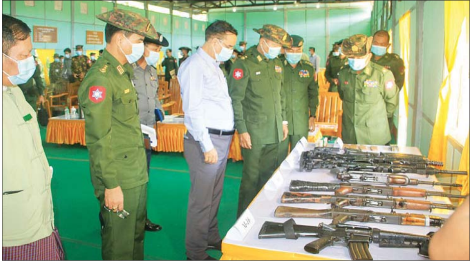
ဆက်လက်၍ တိုင်းဒေသကြီးဝန်ကြီးချုပ်၊ တောင်ပိုင်းတိုင်းစစ်ဌာနချုပ် တိုင်းမှူးနှင့် အဖွဲ့သည် ပဲခူးတိုင်းဒေသကြီးအစိုးရအဖွဲ့ ခွင့်ပြုရန်ပုံငွေဖြင့် ဆောင်ရွက်လျက်ရှိသော ပြည်မြို့ ကမ်းနားလမ်း တိုးချဲ့ဆောင်ရွက်နေမှုကို ကွင်းဆင်းကြည့်ရှုစစ်ဆေး ပြီး ကျန်ရှိသည့်အပိုင်းအား ဆက်လက်ဆောင်ရွက် နိုင်ရေး တွက်ချက်တင်ပြရန်၊ ကမ်းနားလမ်း တစ်လျှောက် ခွင့်ပြုပေးထားသည့် မြေငှားဂရန်ပါ ဧရိယာအတိုင်း ဆောင်ရွက်ရန်နှင့် ကျော်လွန်အသုံးပြု မှုမရှိစေရေး မြေပြင်ကွင်းဆင်းတိုင်းတာ၍ ပြန်လည် တင်ပြရန် တာဝန်ရှိသူများအား မှာကြားသည်။ သတင်းစဉ်

တိုင်းဒေသကြီးဝန်ကြီးချုပ် ဦးမျိုးဆွေဝင်းက ချီးမြှင့် ငွေကျပ် ၁၁၄ သိန်းနှင့် ဂုဏ်ပြုမှတ်တမ်းကိုလည်း ကောင်း၊ တောင်ပိုင်းတိုင်းစစ်ဌာနချုပ် တိုင်းမှူး ဗိုလ်ချုပ်ထိန်ဝင်းက ဂုဏ်ပြုမှတ်တမ်းနှင့် ဂုဏ်ပြု လက်ဆောင်များကိုလည်းကောင်း၊ ဒေသကွပ်ကဲမှု စစ်ဌာနချုပ်(ပြည်)မှ ဂုဏ်ပြုငွေကျပ် ငါးသိန်း၊ ပန်းတောင်းတပ်နယ်မှ ဂုဏ်ပြုငွေကျပ် ငါးသိန်းနှင့် လုံခြုံရေးနှင့် နယ်စပ်ရေးရာဝန်ကြီးက ဂုဏ်ပြု လက်ဆောင်များ ဂုဏ်ပြုချီးမြှင့်ကြသည်။ ယင်းနောက် တိုင်းဒေသကြီးဝန်ကြီးချုပ်၊ တောင်ပိုင်းတိုင်းစစ်ဌာနချုပ် တိုင်းမှူးနှင့် တာဝန်ရှိသူ များက ဂုဏ်ပြုခံလုံခြုံရေးတပ်ဖွဲ့ဝင်များနှင့် အတူတကွ ရင်းရင်းနှီးနှီး နံနက်စာသုံးဆောင်ကြပြီး ဖမ်းဆည်းရမိခဲ့သည့် လက်နက်ခဲယမ်းများအား ကြည့်ရှုကြသည်။