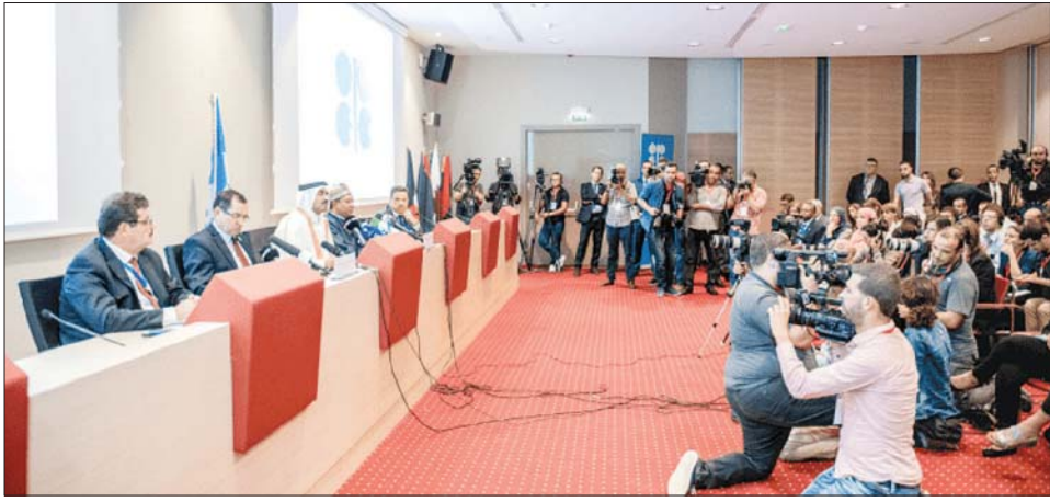
အိုပက်အစည်းအဝေးတစ်ခုတွင် သတင်းထောက်များ သတင်းရယူနေသည်ကို တွေ့ရစဉ်။

အိုပက်အဖွဲ့မှ စွမ်းအင်ဝန်ကြီးများနှင့် ၎င်းတို့၏ မဟာမိတ်များသည် မတ်လအတွင်းက