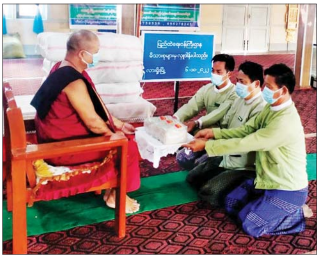
(မြောက်ပိုင်း) မြို့နယ်ရှိ ထေရဝါဒ ဓမ္မရောင်ခြည် ပရိယတ္တိစာသင်တိုက်၊ မရမ်းကုန်းမြို့နယ်ရှိ တိပိဋက မဟာဂန္ဓာရုံကျောင်းတိုက်၊ လှိုင်သာယာ(အရှေ့ပိုင်း)မြို့နယ်ရှိ

နေပြည်တော် အောက်တိုဘာ ၆ ပြည်ထဲရေးဝန်ကြီးဌာန၊ တပ်ဖွဲ့ဝင်/ဝန်ထမ်း အရာထမ်း၊ အမှုထမ်း မိသားစုများက မြို့နယ်အသီးသီးရှိဘုန်းတော်ကြီးကျောင်းများသို့ ဆွမ်းဆန်တော်နှင့် ဆန်ကြာဆံများ ဆက်ကပ်လှူဒါန်းလျက်ရှိသည်။