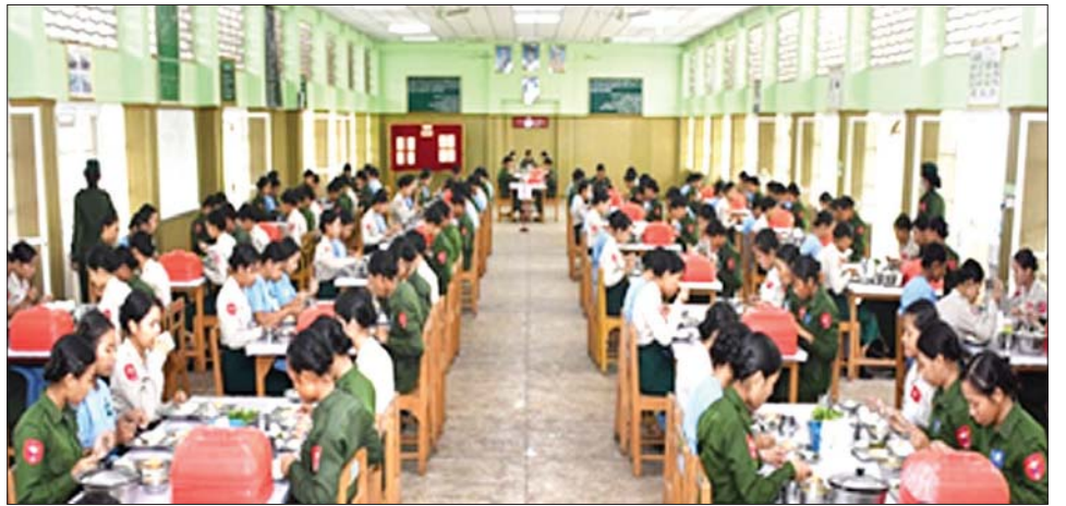
အရာရှိ၊ စစ်သည်၊ မိသားစုများအား ရင်းရင်းနှီးနှီး မိသားစုများနှင့် အတူတကွ နေ့လယ်စာ သုံးဆောင် တွေ့ဆုံနှုတ်ဆက်ပြီး ဂုဏ်ပြုစားပွဲများပြုလုပ်၍ ခွဲကြောင်း သိရသည်။

အလားတူ တိုင်းစစ်ဌာနချုပ်များအလိုက် တပ်နယ်အသီးသီးမှ တပ်မတော်အရာရှိကြီးများ ကလည်း ၎င်းတို့၏ကွပ်ကဲမှုများအလိုက် တပ်ရင်း/ တပ်ဖွဲ့များနှင့် နယ်မြေခံသင်တန်းကျောင်းများမှ