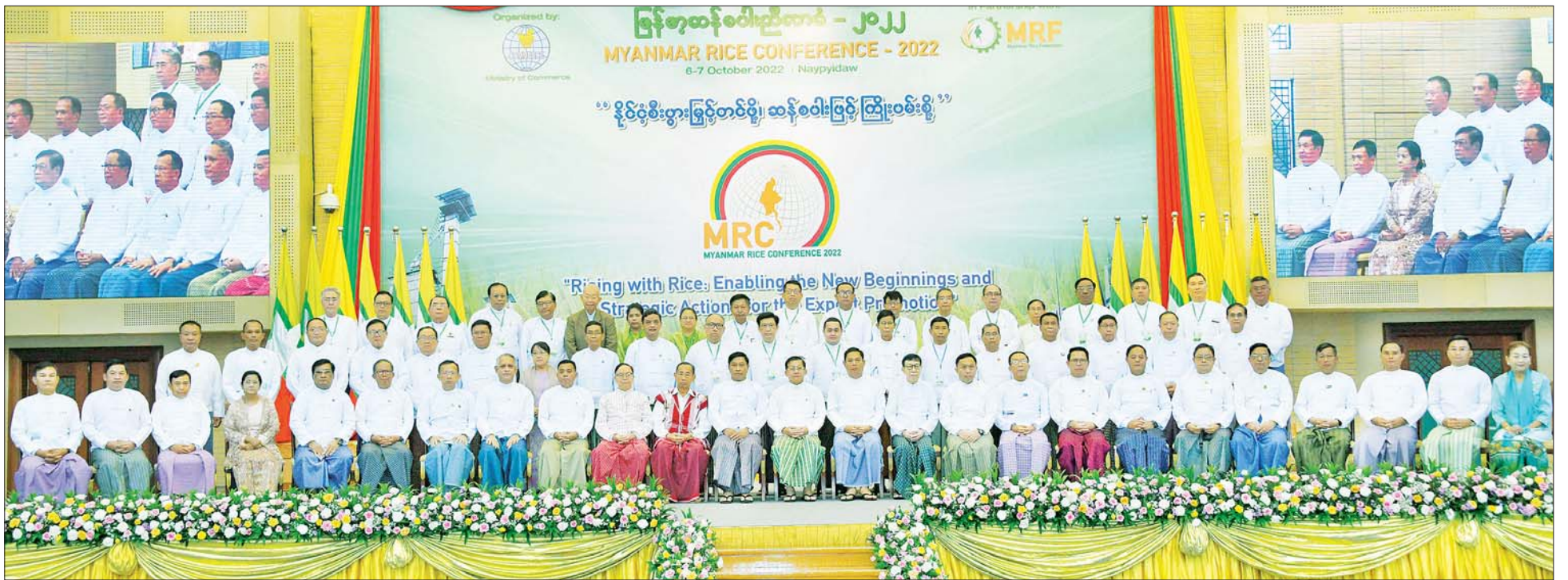
နိုင်ငံတော်စီမံအုပ်ချုပ်ရေးကောင်စီဥက္ကဋ္ဌ နိုင်ငံတော်ဝန်ကြီးချုပ် ဗိုလ်ချုပ်မှူးကြီး မင်းအောင်လှိုင်နှင့် အဖွဲ့ဝင်များ အခမ်းအနားတက်ရောက်လာကြသူများနှင့်အတူ စုပေါင်းမှတ်တမ်းတင်ဓာတ်ပုံရိုက်ကြစဉ်။