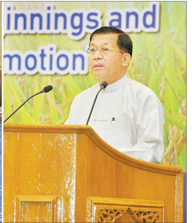
နိုင်ငံတော်စီမံအုပ်ချုပ်ရေးကောင်စီဥက္ကဋ္ဌ နိုင်ငံတော်ဝန်ကြီးချုပ် ဗိုလ်ချုပ်မှူးကြီး မင်းအောင်လှိုင် မြန်မာ့ဆန်စပါး ညီလာခံ -၂၀၂၂ ဖွင့်ပွဲအခမ်းအနားတွင် အမှာစကားပြောကြားစဉ်။