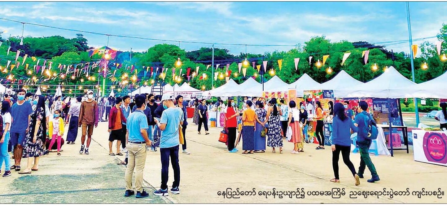
နေပြည်တော် ရေပန်းဥယျာဉ်၌ ပထမအကြိမ် ညဈေးရောင်းပွဲတော် ကျင်းပစဉ်။