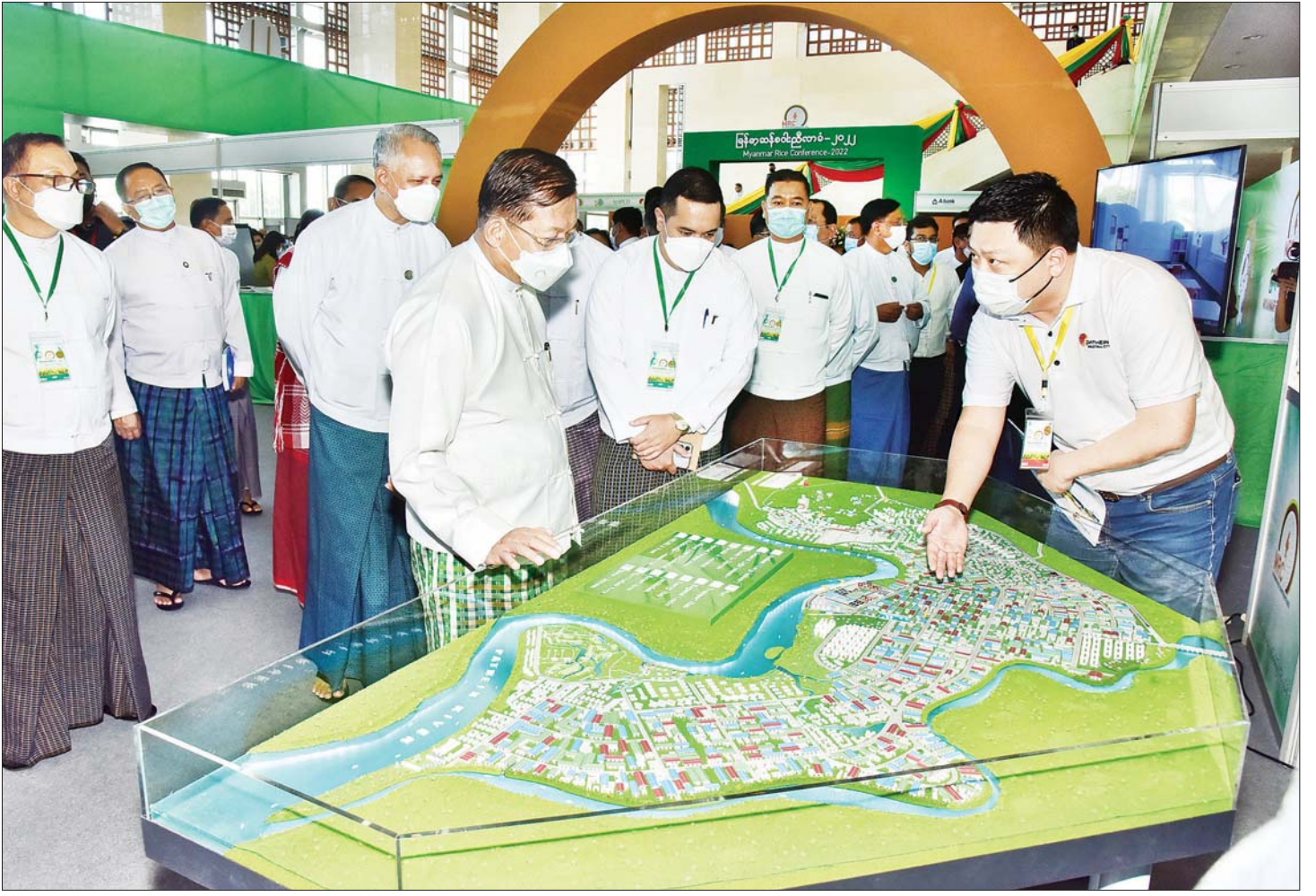
နိုင်ငံတော်စီမံအုပ်ချုပ်ရေးကောင်စီဥက္ကဋ္ဌ နိုင်ငံတော်ဝန်ကြီးချုပ် ဗိုလ်ချုပ်မှူးကြီး မင်းအောင်လှိုင် မြန်မာနိုင်ငံဆန်စပါးအထူးပြုပြင်ရေးအဖွဲ့အား ကြည့်ရှုလေ့လာစဉ်။

ထို့ပြင် ပြည်တွင်းဆန်ရိက္ခာဖူလုံလိုလျှင် ပြည်ပသို့ ပို့ချနိုင်ရေးအတွက်လည်း စပါးစိုက်ဧကများ