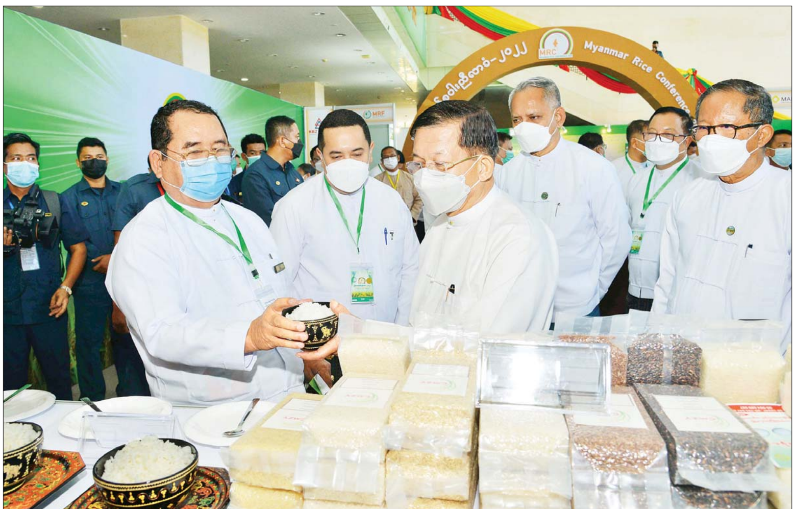
နိုင်ငံတော်စီမံအုပ်ချုပ်ရေးကောင်စီဥက္ကဋ္ဌ နိုင်ငံတော်ဝန်ကြီးချုပ် ဗိုလ်ချုပ်မှူးကြီး မင်းအောင်လှိုင် မြန်မာ့ဆန်စပါး ညီလာခံ - ၂၀၂၂ ဖွင့်ပွဲအခမ်းအနားတွင် ခင်းကျင်း ပြသထားသော မြန်မာနိုင်ငံဆန်စပါးအထူးပြုပြင်ခန်းများအား ကြည့်ရှုအားပေးစဉ်။

နေပြည်တော် အောက်တိုဘာ ၆ မြန်မာနိုင်ငံ၏ ဆန်စပါးကဏ္ဍ ဖွံ့ဖြိုး တိုးတက်ရေးအတွက် ဆက်လက်ဆောင် ရွက်သင့်သည့် လုပ်ငန်းစဉ်များ ကြံ့တော့ ရ သည့် အခက်အခဲများနှင့် ဆန်စပါးကဏ္ဍ ၏ အနာဂတ်ဦးတည်လားရာများကို လေ့လာသုံးသပ်ပြီး အမျိုးသားပို့ကုန် မဟာဗျူဟာနှင့်အညီ ဆန်စပါး စိုက်ပျိုး ထုတ်လုပ်၊ ကြိတ်ခွဲ၊ သိုလှောင်၊ တင်ပို့ ရောင်းချခြင်း တန်ဖိုးကွင်းဆက်တစ် လျှောက် ဆောင်ရွက်ရမည့်လုပ်ငန်းများ ပြုပြင်ပြောင်းလဲတပ်ဆင်ရမည့် အစီ အစဉ်များ၊ အစိုးရနှင့် ပုဂ္ဂလိက ကဏ္ဍများ မှ ဆောင်ရွက်ရမည့် လုပ်ငန်းအစီအစဉ် များကို ဆွေးနွေးဖော်ထုတ်ရန် ရည်ရွယ်၍ “နိုင်ငံစီးပွားမြှင့်တင်ဖို့ ဆန်စပါးဖြင့် ကြိုးပမ်းစို့” ဟူသည့် ခေါင်းစဉ်ဖြင့် ကျင်းပပြုလုပ်သည့် မြန်မာ့ဆန်စပါး ညီလာခံ - ၂၀၂၂ (Myanmar Rice Conference - 2022) ဖွင့်ပွဲအခမ်းအနားကို ယနေ့ နံနက်ပိုင်းတွင် နေပြည်တော်ရှိ မြန်မာအပြည်ပြည်ဆိုင်ရာ ကွန်ဗင်းရှင်း (ဗဟိုဌာန-၂)၌ ကျင်းပပြုလုပ်ရာ နိုင်ငံ တော် စီမံအုပ်ချုပ်ရေးကောင်စီဥက္ကဋ္ဌ နိုင်ငံတော်ဝန်ကြီးချုပ် ဗိုလ်ချုပ်မှူးကြီး မင်းအောင်လှိုင် တက်ရောက်အမှာစကား ပြောကြားသည်။ စာမျက်နှာ ၃ ကော်လံ ၁ ၀