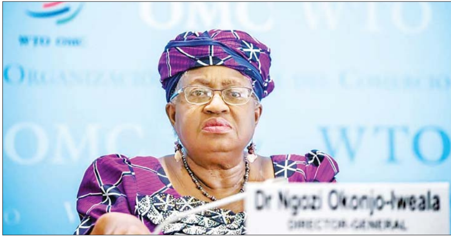
ကမ္ဘာ့ကုန်သွယ်ရေးအဖွဲ့ကြီး၏ ညွှန်ကြားရေးမှူးချုပ် နာဂိုဇီ အိုခွန်ဂျီ အိဇီလာ

အမေရိကန်ပြည်ထောင်စုအပါအဝင် ကမ္ဘာတစ်လွှား ငွေရေးကြေးရေးအခက်အခဲများကြောင့် စီးပွားရေးတိုးတက်မှုတွင် သက်ရောက်မှုများ ဖြစ်ပေါ်ခဲ့သည်။ ဥရောပတွင် စွမ်းအင်ဈေးနှုန်းများ ကြီးမြင့်သည့်အတွက် အိမ်ထောင်စုများနှင့် စီးပွားရေးလုပ်ငန်းများတွင် ဖိအားများ ဖြစ်စေခဲ့သည်။ အင်န်အိတ်ချ်ကေ