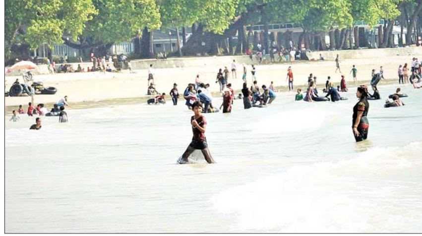
ယမန်နှစ်က ပထမဆုံးကျင်းပသော ဆောင်းဦးပွဲတော်တွင် ငပလီကမ်းခြေ၌ ရေကစားအပန်းဖြေနေသူများ။