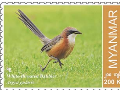
အောက်တိုဘာ ၉ ရက်၌ ဝယ်ယူသော စာပို့တံဆိပ်ခေါင်းများပေါ်တွင် နေ့စွဲအမှတ်အသား တံဆိပ်ရိုက်နှိပ်ပေးမည်ဖြစ်ကြောင်း သိရသည်။

၉ ရက်၊ (တနင်္ဂနွေနေ့) နံနက် ၉ နာရီခွဲမှ စတင်၍ နေပြည်တော် ဗဟိုစာတိုက်ကြီး၊ ရန်ကုန်စာတိုက်ကြီး၊ မန္တလေးစာတိုက်ကြီး တို့နှင့် တိုင်းဒေသကြီး/ ပြည်နယ်များရှိ စာတိုက်ကြီးများတွင် တစ်ပြိုင်တည်းရောင်းချပေးသွားမည်ဖြစ်သည်။ အထူးအစီအစဉ် တစ်ရပ်အနေဖြင့် နေပြည်တော် ဗဟိုစာတိုက်ကြီး၊ ရန်ကုန်စာတိုက်ကြီးနှင့် မန္တလေးစာတိုက်ကြီးတို့တွင်