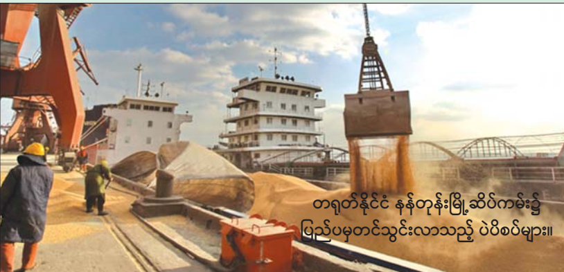
တရုတ်နိုင်ငံ နန်တုန်းမြို့ဆိပ်ကမ်း၌ ပြည်ပမှတင်သွင်းလာသည့် ပဲစိပ်များ။

စားနပ်ရိက္ခာဖူလုံမှု သေချာစေရန် အတွက် ပဲစိပ်သုံးစွဲမှုကို လျော့ချမည့် တရုတ်အစိုးရသည် လယ်သမားများအား အစားထိုးစိုက်ပျိုးထုတ်လုပ်ရမည့် အခြား သီးနှံများ အလွယ်တကူရရှိရန်နှင့် နည်းလမ်း သစ်များဖြင့် ပိုမိုကောင်းမွန်သော ထောက်ပံ့ ရေး ကွင်းဆက်များ ပံ့ပိုးပေးနိုင်ရန်လိုအပ် နေပြီဖြစ်ကြောင်း ကျွမ်းကျင်သူများက ပြော ကြားသည်။