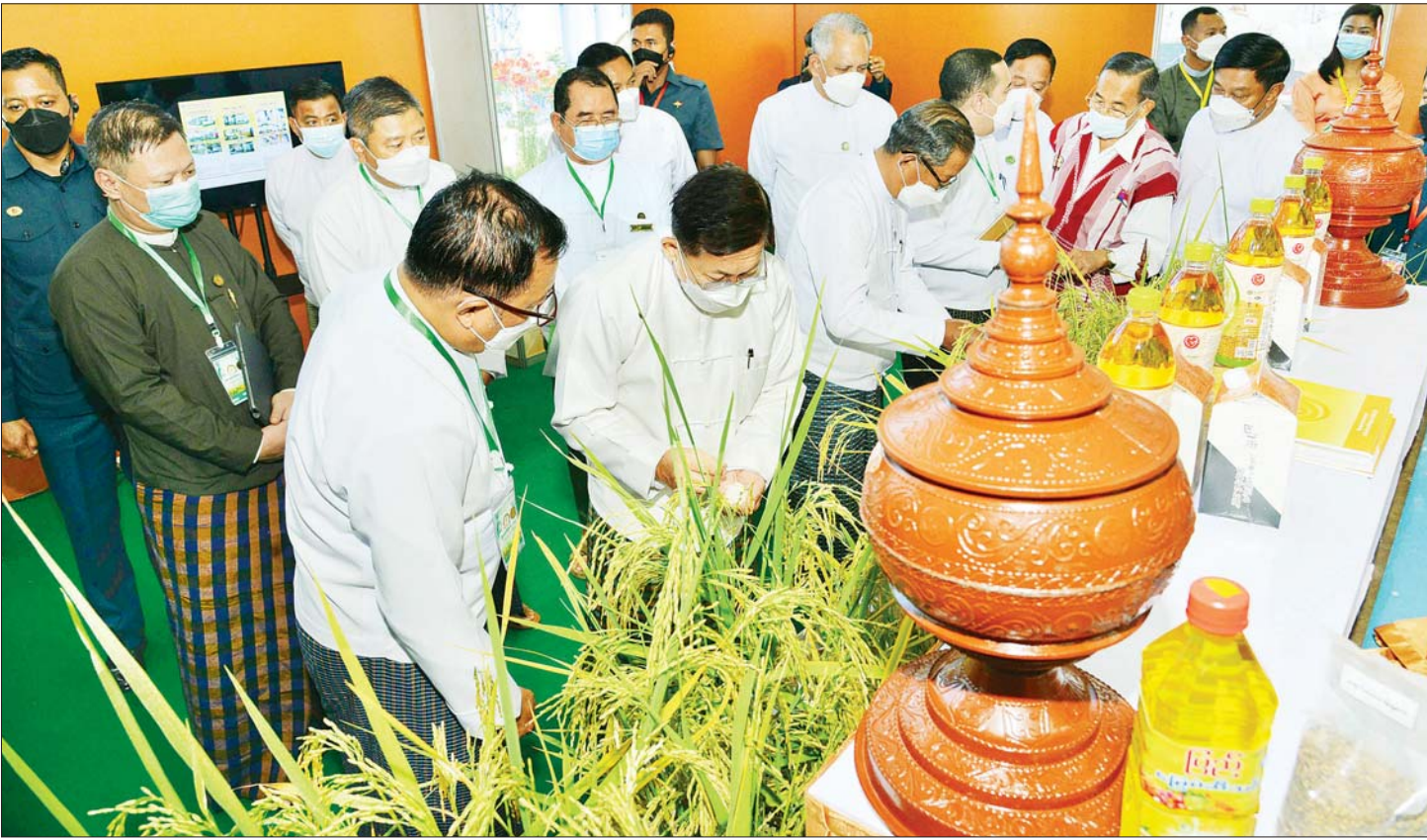
နိုင်ငံတော်စီမံအုပ်ချုပ်ရေးကောင်စီဥက္ကဋ္ဌ နိုင်ငံတော်ဝန်ကြီးချုပ် ဗိုလ်ချုပ်မှူးကြီး မင်းအောင်လှိုင် မြန်မာနိုင်ငံဆန်စပါးအထူးပြုပြင်ရေးအဖွဲ့အား ကြည့်ရှုအားပေးစဉ်။