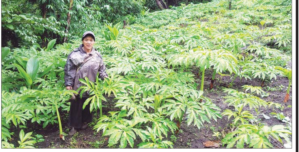
ချင်းပြည်နယ်၌ စိုက်ပျိုးထားသည့် ဝဥစိုက်ခင်းကို တွေ့ရစဉ်။

များ၏ လူမှုစီးပွားဘဝ ဖွံ့ဖြိုးတိုးတက်လာခြင်းသည် နိုင်ငံတော်ဖွံ့ဖြိုးတိုးတက်ရေးအတွက် များစွာ အထောက်အကူဖြစ်စေမည်ဖြစ်ပါကြောင်း ရေးသား တင်ပြလိုက်ရပါသည်။ ။