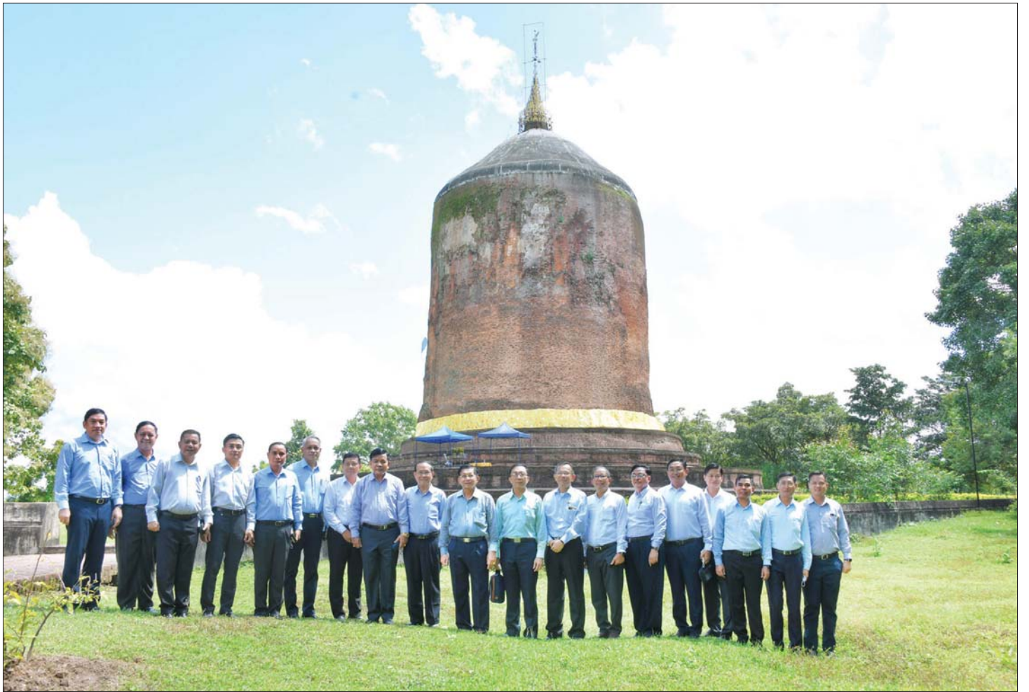
နိုင်ငံတော်စီမံအုပ်ချုပ်ရေးကောင်စီဥက္ကဋ္ဌ နိုင်ငံတော်ဝန်ကြီးချုပ် ဗိုလ်ချုပ်မှူးကြီး မင်းအောင်လှိုင်နှင့် အဖွဲ့ဝင်များ ရှေးဟောင်းသမိုင်းဝင် ဘောဘောကြီး စေတီရှေ့တွင် စုပေါင်းမှတ်တမ်းတင် ဓာတ်ပုံရိုက်စဉ်။

အဆိုပါ သရေခေတ္တရာမြို့ဟောင်းသည် မြန်မာနိုင်ငံတွင်ရှိသည့် ပျူမြို့ဟောင်းများအနက် အကြီးဆုံးနှင့် သက်တမ်းအရှည်ဆုံးမြို့ဖြစ်ပြီး သရေခေတ္တရာဟူသောအမည်သည် “ကျက်သရေ မင်္ဂလာအပေါင်းနှင့် ပြည့်စုံသောမြို့”ဟု အဓိပ္ပာယ် ရကြောင်း၊ ပဲခူးတိုင်းဒေသကြီး ပြည်မြို့ အရှေ့တောင် ဘက် ၅ မိုင်ခန့်အကွာ မှော်ဇောရွာတွင် တည်ရှိပြီး