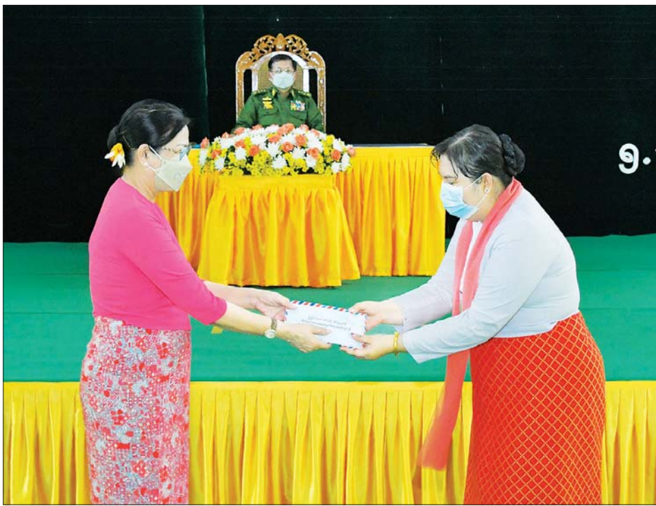
နိုင်ငံတော်စီမံအုပ်ချုပ်ရေးကောင်စီဥက္ကဋ္ဌ တပ်မတော်ကာကွယ်ရေးဦးစီးချုပ် ဗိုလ်ချုပ်မှူးကြီးမင်းအောင်လှိုင် ၏ ဇနီး ဒေါ်ကြူကြူလှ တပ်နယ်မိခင်နှင့် ကလေးစောင့်ရှောက်ရေးအသင်းအတွက် ချီးမြှင့်ငွေများ ပေးအပ်စဉ်။

ကိုဗစ်-၁၉ ဆိုင်ရာ စည်းကမ်းချက်များကို လိုက်နာဆောင်ရွက် ကိုဗစ် - ၁၉ ရောဂါ ဖြစ်ပွားခဲ့မှုနှင့်ပတ်သက်၍