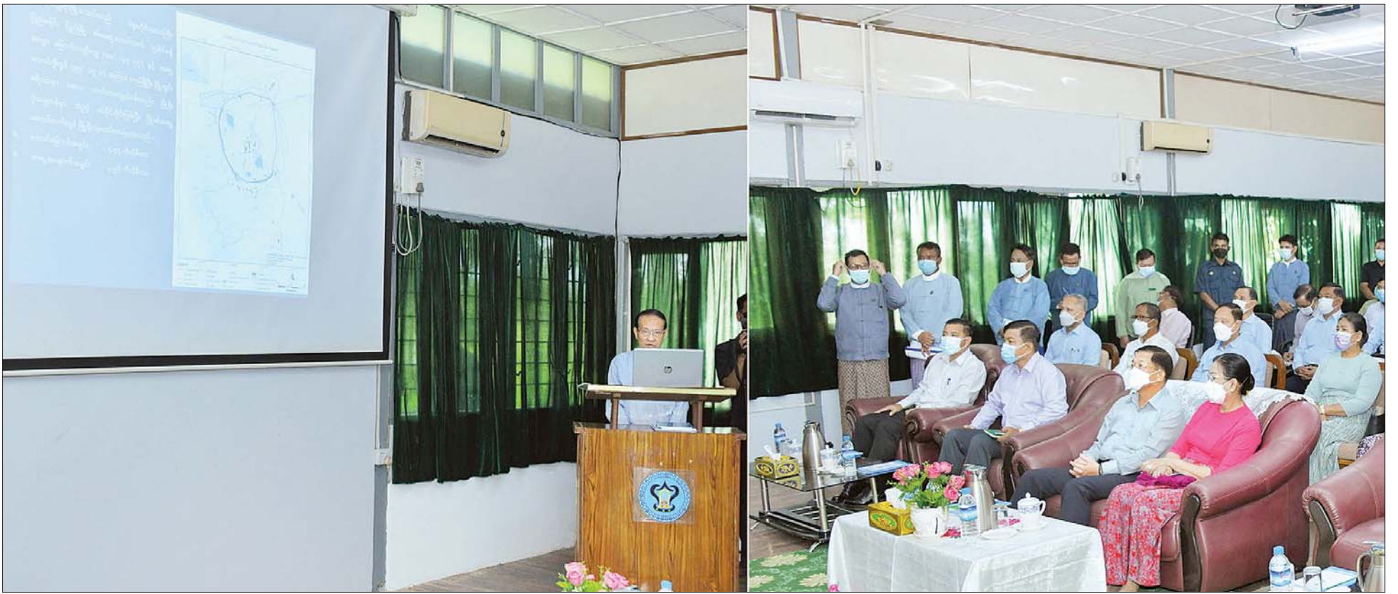
နိုင်ငံတော်စီမံအုပ်ချုပ်ရေးကောင်စီဥက္ကဋ္ဌ နိုင်ငံတော်ဝန်ကြီးချုပ် ဗိုလ်ချုပ်မှူးကြီး မင်းအောင်လှိုင် အား ပြည်ထောင်စုဝန်ကြီး ဦးကိုကိုက သရေခေတ္တရာမြို့ဟောင်းဆိုင်ရာများနှင့် ပတ်သက်ပြီး ရှင်းလင်းတင်ပြစဉ်။

ရှေ့ဖို့မှ ဦးစွာ နိုင်ငံတော်စီမံအုပ်ချုပ်ရေးကောင်စီဥက္ကဋ္ဌ နိုင်ငံတော်ဝန်ကြီးချုပ်နှင့် အဖွဲ့ဝင်များသည် သရေခေတ္တရာမြို့ဟောင်းသို့ ရောက်ရှိကြရာ တာဝန်ရှိသူများက ကြိုဆိုနှုတ်ဆက်ကြသည်။ ရှင်းလင်းတင်ပြ