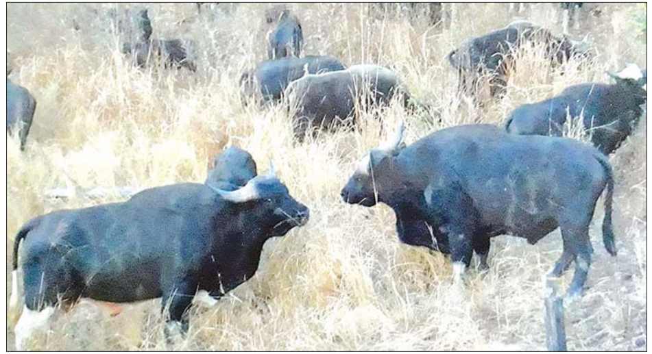
ချင်းပြည်နယ်တွင် လွတ်ကျောင်းစနစ်ဖြင့် မွေးမြူထားသည့် နွားနောက်များ။