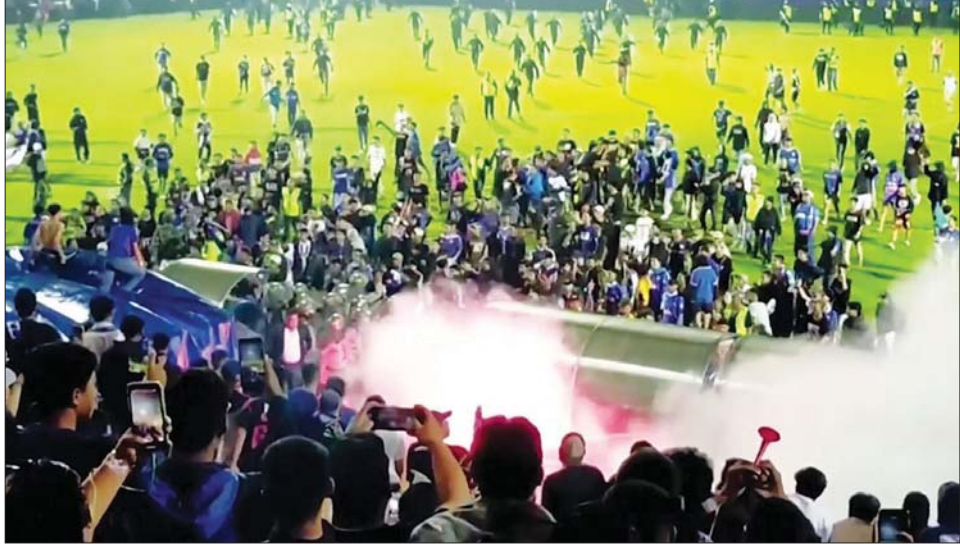
အင်ဒိုနီးရှားနိုင်ငံ၌ ဘောလုံးပြိုင်ပွဲကွင်းအတွင်း ရုန်းရင်းဆန်ခတ်ဖြစ်ပွားမှုကို တွေ့ရစဉ်။

အင်ဒိုနီးရှားအစိုးရက ရုန်း ရင်းဆန်ခတ်ဖြစ်ပွားမှုမှ ဖြစ်ရပ် အမှန်ကို စုံစမ်းစစ်ဆေးဖော်ထုတ် ရန် လွတ်လပ်သော အချက် အလက်ရှာဖွေရေးအဖွဲ့ကို ဖွဲ့စည်း လိုက်ကြောင်း သိရသည်။ ဆင်ဟွာ