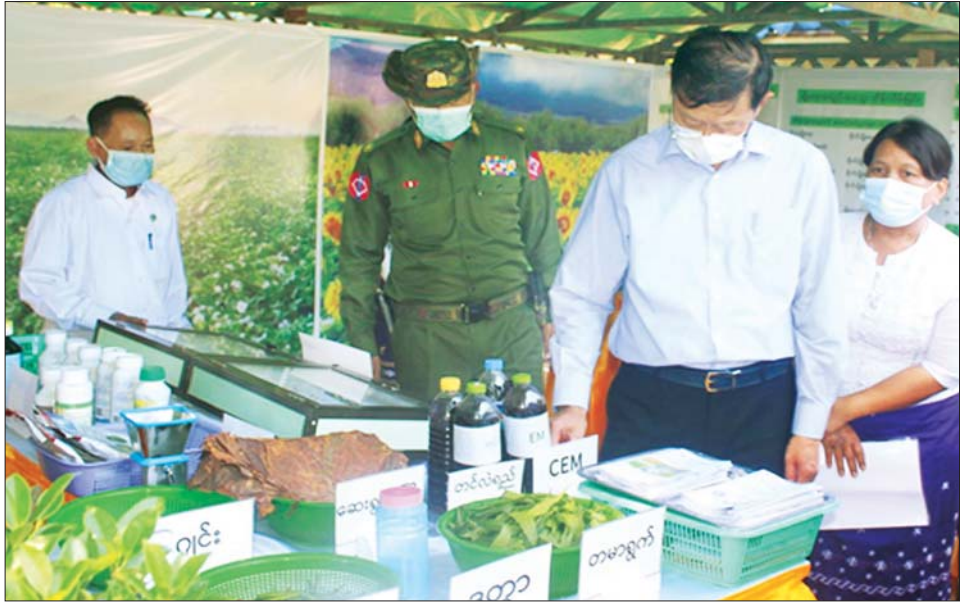
ပြည်ထောင်စုဝန်ကြီး ဗိုလ်ချုပ်ကြီး မြထွန်းဦး စစ်ကိုင်းခရိုင် စိုက်ပျိုးရေးနှင့် မွေးမြူရေး ထုတ်ကုန်တိုးမြှင့်ပြပွဲကြည့်ရှုအားပေးစဉ်။

ထို့နောက် နိုင်ငံတော်စီမံအုပ်ချုပ်ရေးကောင်စီအဖွဲ့ဝင်၊ ကာကွယ်ရေးဝန်ကြီးဌာန ပြည်ထောင်စုဝန်ကြီး ဗိုလ်ချုပ်ကြီးမြထွန်းဦးက လိုအပ်သည်များ ဖြည့်စွက်မှာကြားသည်။ ဆက်လက်၍ ပြည်ထောင်စုဝန်ကြီး၊ တိုင်းဒေသကြီးဝန်ကြီးချုပ်၊ အနောက်မြောက်တိုင်း စစ်ဌာနချုပ် တိုင်းမှူးနှင့် တာဝန်ရှိသူများက သဘာဝမြေဩဇာစက်ရုံများကို တောင်သူများသို့ အခမဲ့ဖြန့်ဝေပေးသည်။ ယင်းနောက် ပြည်ထောင်စုဝန်ကြီးနှင့် တာဝန်ရှိသူများသည် စစ်ကိုင်းတိုင်းဒေသကြီး၊ စစ်ကိုင်းခရိုင် စိုက်ပျိုးရေးနှင့် မွေးမြူရေး ထုတ်ကုန်များ တိုးမြှင့်ရေး ပြုပြင်မှုနှင့် မျိုးစေ့၊ သွင်းအားစုများ ထောက်ပံ့ပေးအပ်ခြင်း အခမ်းအနားသို့ တက်ရောက်ကြည့်ရှု အားပေးပြီး ပြည်ထောင်စုဝန်ကြီး၊ တိုင်းဒေသကြီးဝန်ကြီးချုပ်၊ တိုင်းမှူးနှင့် တာဝန်ရှိသူများက နေကြာမျိုးစေ့များ၊ ဂျုံသီးနှံမျိုးစေ့နှင့် ချည်မျှင်ရည်ဝါမျိုးစေ့များ ထောက်ပံ့ပေးအပ်ခဲ့ကြောင်း သတင်းရရှိသည်။ သတင်းစဉ်