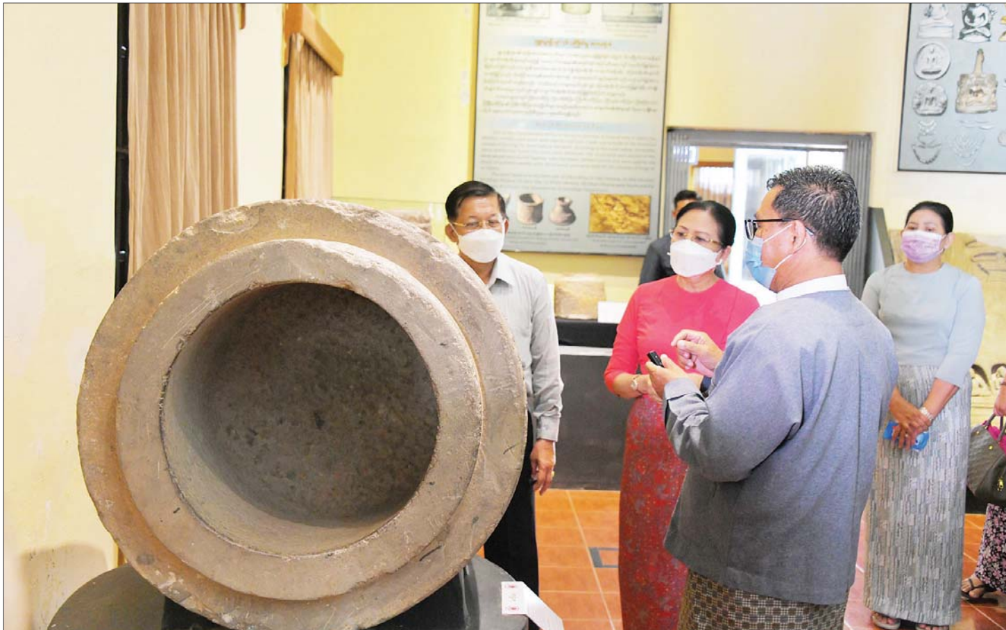
နိုင်ငံတော်စီမံအုပ်ချုပ်ရေးကောင်စီဥက္ကဋ္ဌ နိုင်ငံတော်ဝန်ကြီးချုပ် ဗိုလ်ချုပ်မှူးကြီး မင်းအောင်လှိုင်နှင့် ဇနီး ဒေါ်ကြူကြူလှ တို့ သရေခေတ္တရာယဉ်ကျေးမှုဇုန်အတွင်းရှိ သီရိခေတ္တရာပြတိုက်အတွင်း ကြည့်ရှုလေ့လာစဉ်။