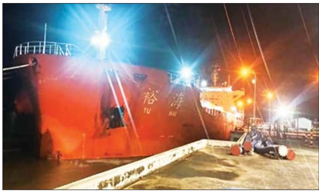
ကော်မတီအနေဖြင့် အချို့စက်သုံး ဆီအရောင်းဆိုင်များ၌ သတ်မှတ် ရည်ညွှန်းဈေးနှုန်းထက် ပိုမိုရောင်း ချသည့် စက်သုံးဆီအရောင်း ဆိုင်များအား စိစစ်၍ ရေနံနှင့် ရေနံထွက်ပစ္စည်းဆိုင်ရာ ဥပဒေ (၂၀၁၇) အရ အရေးယူဆောင်ရွက် လျက်ရှိကြောင်း သတင်းရရှိသည်။

စက်သုံးဆီ တင်သွင်းသို့လှောင်ဆောင်ရွက်လျက်ရှိပြီး စက်သုံးဆီ ဖြန့်ဖြူးခြင်းလုပ်ငန်းကြီးကြပ်ရေး လက်ကူအခြေအနေအရ စက် ကော်မတီသည် ပြည်တွင်း သုံးဆီဖူလုံမှုရှိကြောင်း တွေ့ရှိရ သည်။ စက်သုံးဆီ အမျိုးအစားများ ယခု ရက်သတ္တပတ်အတွင်း အလိုက် ပုံမှန်စီမံတင်သွင်း စက်သုံးဆီ ဈေးနှုန်းများတွင် ဆောင်ရွက်လျက်ရှိရာ အောက်တို ဓာတ်ဆီဈေးနှုန်းမှာ တဖြည်း ဘာ ၃ ရက်က ရန်ကုန်တိုင်း ဖြည်း ကျဆင်းလာသော်လည်း ဒေသကြီး သီလဝါဆိပ်ကမ်းရှိ ဒီဇယ်ဈေးနှုန်းမှာ ကမ္ဘာ့စက်သုံးဆီ Terminal တွင် MT YU HAI ဈေးနှုန်း မြင့်တက်လာမှုကြောင့် သင်္ဘောမှ ဓာတ်ဆီ 92 Ron အနည်းငယ်မြင့်တက်လာသည်ကို တွေ့ရှိရသည်။ စက်သုံးဆီတင်သွင်းသို့လှောင် ဖြန့်ဖြူးခြင်းလုပ်ငန်းကြီးကြပ်ရေး သန်း ဆီချလုပ်ငန်း စတင်