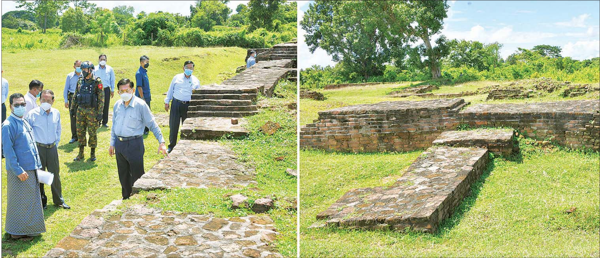
နိုင်ငံတော်စီမံအုပ်ချုပ်ရေးကောင်စီဥက္ကဋ္ဌ နိုင်ငံတော်ဝန်ကြီးချုပ် ဗိုလ်ချုပ်မှူးကြီး မင်းအောင်လှိုင် ပဲခူးတိုင်းဒေသကြီး ပြည်မြို့ရှိ သရေခေတ္တရာမြို့ဟောင်း ယဉ်ကျေးမှုဇုန်အတွင်း ကြည့်ရှုစစ်ဆေးစဉ်။

နေပြည်တော် အောက်တိုဘာ ၅ နိုင်ငံတော်စီမံအုပ်ချုပ်ရေးကောင်စီဥက္ကဋ္ဌ နိုင်ငံတော်ဝန်ကြီးချုပ် ဗိုလ်ချုပ်မှူးကြီး မင်းအောင်လှိုင် သည် ဇနီး ဒေါ်ကြူကြူလှ၊ ခရီးစဉ်တွင် လိုက်ပါလာသည့် အဖွဲ့ဝင်များနှင့် ဇနီးများ၊ ပဲခူးတိုင်းဒေသကြီးဝန်ကြီးချုပ်၊ တောင်ပိုင်းတိုင်းစစ်ဌာနချုပ် တိုင်းမှူးနှင့် တာဝန်ရှိသူများလိုက်ပါ၍ ယနေ့နံနက်ပိုင်းတွင် ပဲခူးတိုင်းဒေသကြီး ပြည်မြို့၏ အရှေ့တောင်ဘက် ၅ မိုင်ခန့်အကွာရှိ ပျူမြို့ဟောင်းများအနက် အကြီးဆုံးဖြစ်သည့် သရေခေတ္တရာမြို့ဟောင်း ကမ္ဘာ့အမွေအနှစ်ဒေသသို့ သွားရောက်၍ ရှေးဟောင်းအမွေအနှစ် ထိန်းသိမ်းထားရှိမှုများကို သွားရောက်ကြည့်ရှုစစ်ဆေးသည်။