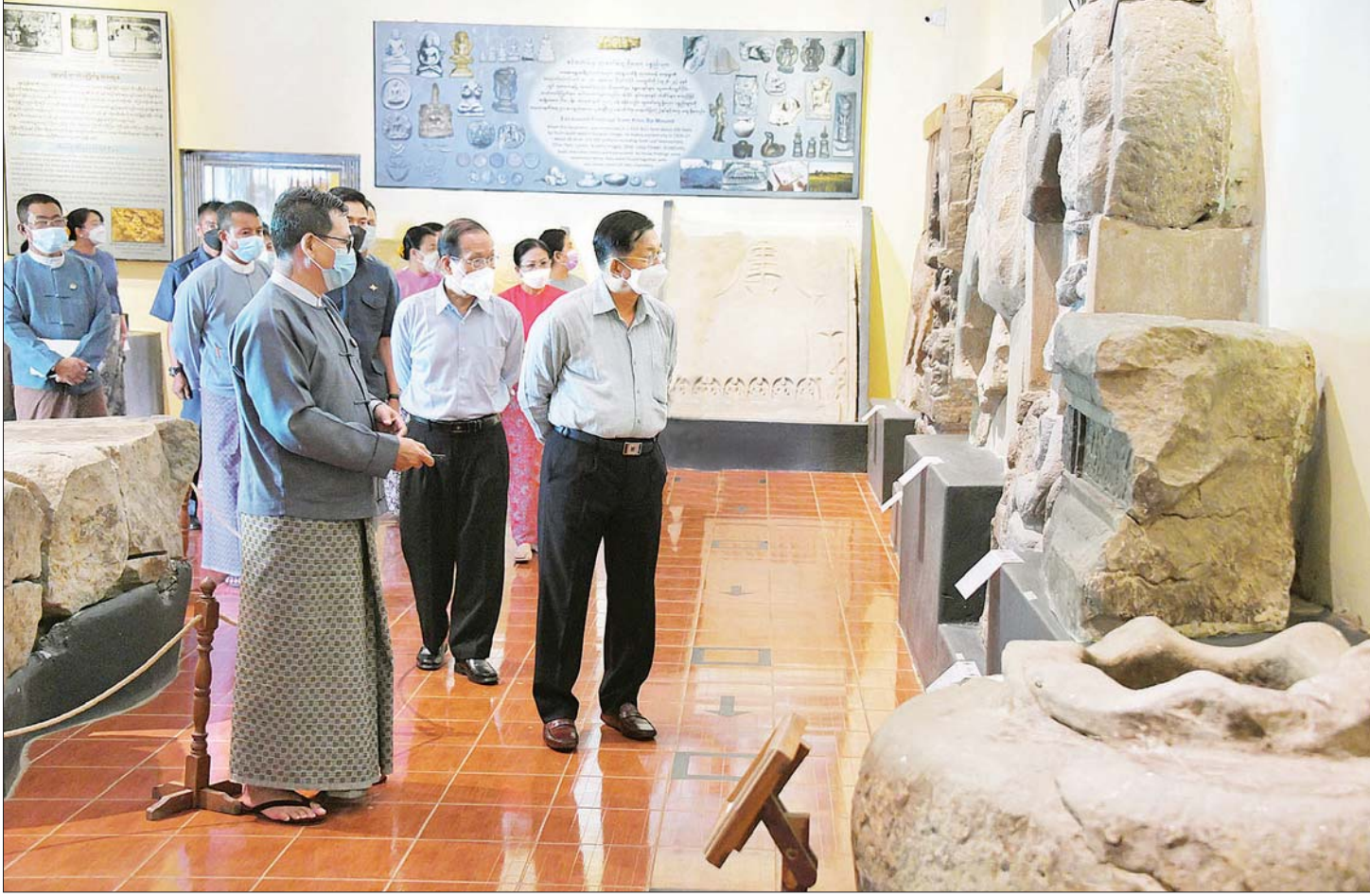
နိုင်ငံတော်စီမံအုပ်ချုပ်ရေးကောင်စီဥက္ကဋ္ဌ နိုင်ငံတော်ဝန်ကြီးချုပ် ဗိုလ်ချုပ်မှူးကြီး မင်းအောင်လှိုင် သရေခေတ္တရာယဉ်ကျေးမှုဇုန်အတွင်းရှိ သီရိခေတ္တရာပြတိုက်အတွင်း ကြည့်ရှုလေ့လာစဉ်။

ရှေးဟောင်းအမွေအနှစ်များကို စနစ်တကျထိန်းသိမ်း တင်ပြချက်များနှင့်စပ်လျဉ်း၍ နိုင်ငံတော်စီမံအုပ်ချုပ်ရေးကောင်စီဥက္ကဋ္ဌ နိုင်ငံတော်ဝန်ကြီးချုပ်က ပျူနှင့်ပတ်သက်၍ ဗိဿနိုး၊ ဟန်လင်းတို့တွင် တူးဖော်ရရှိသည့် ရှေးဟောင်းပစ္စည်းများအရ ရှေးခေတ်ပျူတို့၏ လက်မှုပညာအဆင့်အတန်းမြင့်မားမှုကို တွေ့ရှိရမည်ဖြစ်ကြောင်း၊ ထို့ပြင် ပျူခေတ် ဝတ်စားဆင်ယင်မှုများကိုလည်း ပြန်လည်ဖော်ထုတ်ရန်လိုကြောင်း၊ ယနေ့ခေတ်တွင် ပျူမျိုးဆက်များနှင့်ပတ်သက်၍လည်း သုတေသနပြုရန်လိုကြောင်း၊ ယဉ်ကျေးမှုအရ ပြည်တွင်း ပြည်ပခရီးသွားများ လာရောက်လေ့လာခြင်းဖြင့် ပြည်ဒေသဖွံ့ဖြိုးတိုးတက်ရေးကို အထောက်အကူဖြစ်စေမည်ဖြစ်သဖြင့် ရှေးဟောင်းအမွေအနှစ်များကို စနစ်တကျ ထိန်းသိမ်းကြရန်လိုကြောင်း၊ တူးဖော်ရရှိသည့် စာမျက်နှာ ၄ သို့