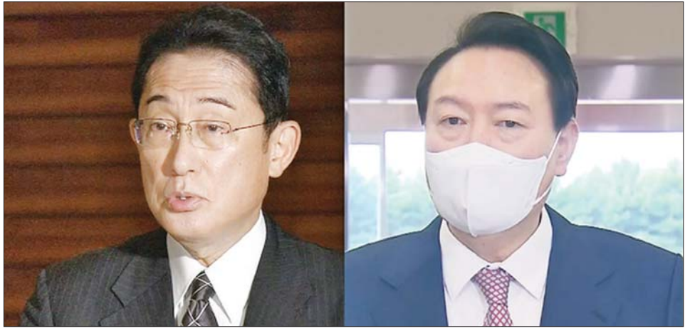
ဂျပန်ဝန်ကြီးချုပ် ကိရှိုဒါဖူမိယိုနှင့် တောင်ကိုရီးယားသမ္မတ ယွန်ဆက်ယိုးလ်။

လွန်ခဲ့သောလက ကိရှိုဒါနှင့် ယွန်တို့သည် ကုလသမဂ္ဂအထွေထွေညီလာခံ သီးသန့်ဆွေးနွေးပွဲတွင် တွေ့ဆုံခဲ့သေးသည်။ နှစ်နိုင်ငံအကြား ထူးခြားသောကိစ္စရပ်များကို ဖြေရှင်းရန် သဘောတူခဲ့ကြသည်။ ထို့ပြင် နှစ်နိုင်ငံ ဆက်ဆံရေးတိုးတက်စေရန်လည်း အတည်ပြုခဲ့ကြသည်။ အင်န်အိတ်ချ်ကော