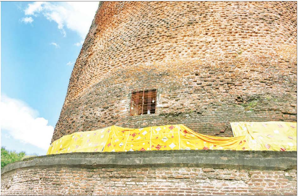
နိုင်ငံတော်စီမံအုပ်ချုပ်ရေးကောင်စီဥက္ကဋ္ဌ နိုင်ငံတော်ဝန်ကြီးချုပ် ဗိုလ်ချုပ်မှူးကြီး မင်းအောင်လှိုင် သရေခေတ္တရာယဉ်ကျေးမှုဇုန်အတွင်း ရှေးဟောင်းသမိုင်းဝင် ဘောဘောကြီးစေတီအား ဖူးမြော်ကြည့်ညှိစဉ်။