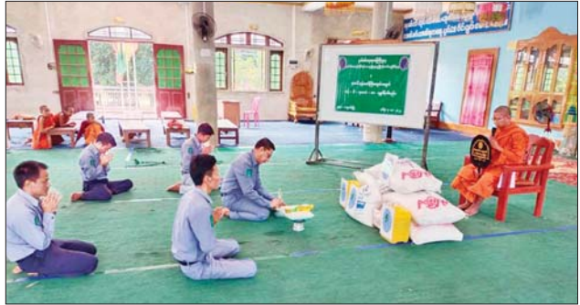
ကျောက်မဲခရိုင်အတွင်းရှိ ဘုန်းတော်ကြီးကျောင်းများအား လှူဖွယ်ပစ္စည်းများ လှူဒါန်း

ခွဲကြပြီးပြည်ထောင်စုရွေးကော်မ ရှင်မရှင်မရှင်မရှင်မရှင်မရှင် လုပ်ငန်း ပေါင်းစပ် ညှိနှိုင်း ဆောင်ရွက်ပေးခဲ့ကြောင်း သိရသည်။ ယင်းအစည်းအဝေးသို့ ပြည် ထောင်စုရွေးကော်မရှင်မရှင်