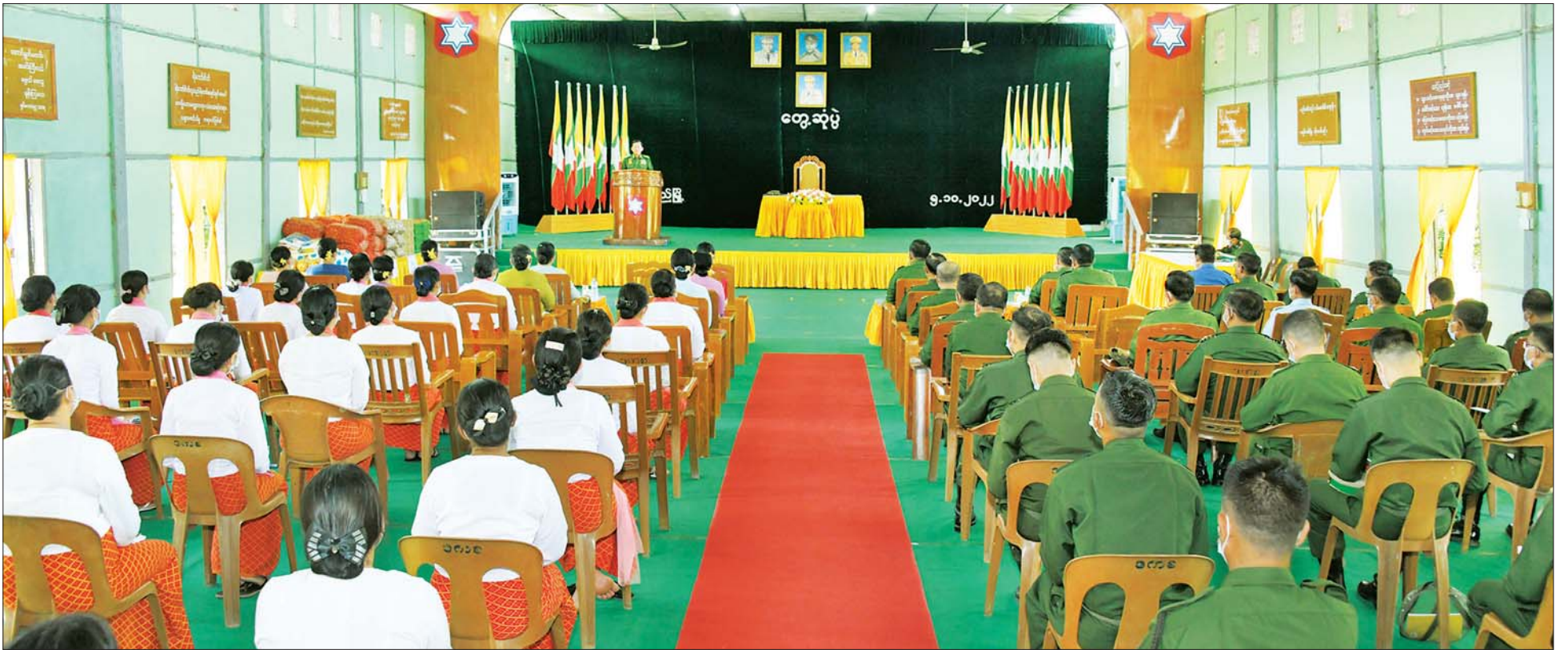
နိုင်ငံတော်စီမံအုပ်ချုပ်ရေးကောင်စီဥက္ကဋ္ဌ တပ်မတော်ကာကွယ်ရေးဦးစီးချုပ် ဗိုလ်ချုပ်မှူးကြီး မင်းအောင်လှိုင် ပြည်တပ်နယ်နှင့် ပန်းတောင်းတပ်နယ်တို့မှ အရာရှိ၊ စစ်သည်မိသားစုဝင်များအား တွေ့ဆုံအမှာစကားပြောကြားစဉ်။