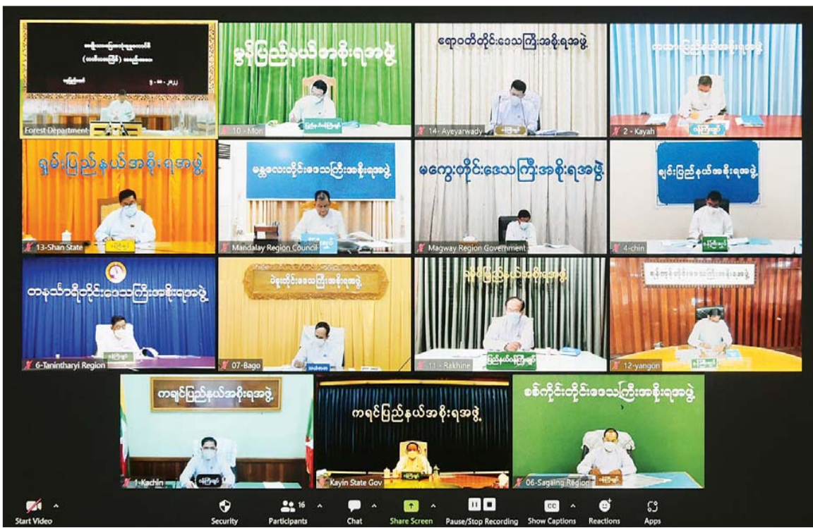
အမျိုးသားမြေအသုံးချမှုကောင်စီ တတိယအကြိမ် အစည်းအဝေးတွင် အမျိုးသားမြေအသုံးချမှုကောင်စီဝင် တိုင်းဒေသကြီးနှင့် ပြည်နယ်ဝန်ကြီးချုပ်များ ဗီဒီယိုကွန်ဖရင့်စနစ်ဖြင့် တက်ရောက်စဉ်။

ကုလသမဂ္ဂစားနပ်ရိက္ခာနှင့် စိုက်ပျိုးရေးအဖွဲ့၏ ခန့်မှန်းချက်အရ ကမ္ဘာ့လူဦးရေတိုးပွားလာမှုနှင့် မြေဆီလွှာယိုယွင်းပျက်စီးမှုတို့ကြောင့် ၂၀၂၀ ပြည့်နှစ်တွင် လူတစ်ဦး စိုက်ပျိုးလုပ်ကိုင်နိုင်သည့် မြေဧရိယာ ၀ ဒသမ ၁၈ ဟက်တာခန့်သာရှိကြောင်း၊ အဆိုပါအခြေအနေကို ၁၉၆၀ ပြည့်နှစ်နှင့်နှိုင်းယှဉ်လျှင် ထက်ဝက်