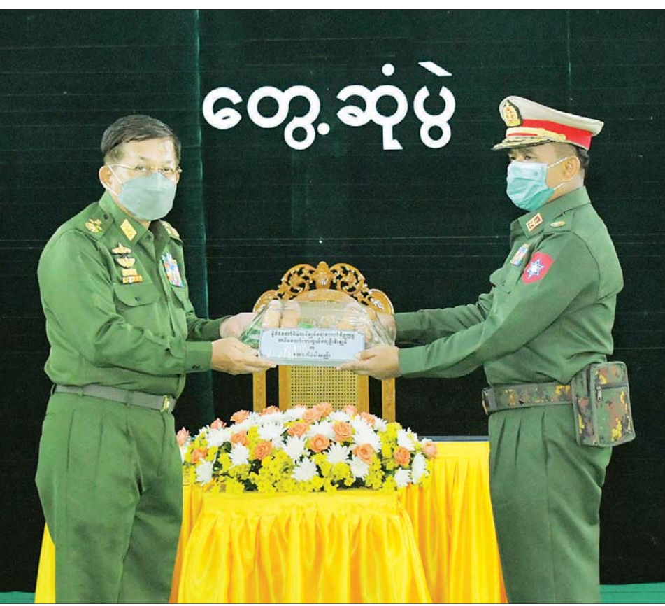
နိုင်ငံတော်စီမံအုပ်ချုပ်ရေးကောင်စီဥက္ကဋ္ဌ တပ်မတော်ကာကွယ်ရေးဦးစီးချုပ် ဗိုလ်ချုပ်မှူးကြီး မင်းအောင်လှိုင် အရာရှိ၊ စစ်သည်၊ မိသားစုများအတွက် စားသောက်ဖွယ်ရာပစ္စည်းများကို ပြည်တပ်နယ်မှူးထံ ပေးအပ်စဉ်။

နေပြည်တော် အောက်တိုဘာ ၅ နိုင်ငံတော်စီမံအုပ်ချုပ်ရေးကောင်စီဥက္ကဋ္ဌ တပ်မတော်ကာကွယ်ရေးဦးစီးချုပ် ဗိုလ်ချုပ်မှူးကြီး မင်းအောင်လှိုင်သည် ယနေ့ မွန်းလွဲပိုင်းတွင် ပြည်တပ်နယ်နှင့် ပန်းတောင်းတပ်နယ်တို့မှ အရာရှိ၊ စစ်သည်မိသားစုဝင်များအား ပြည်တပ်နယ်ရှိ နဝဒေးခန်းမ၌ တွေ့ဆုံအမှာစကား ပြောကြားသည်။ အဆိုပါတွေ့ဆုံပွဲသို့ နိုင်ငံတော်စီမံအုပ်ချုပ်ရေးကောင်စီဥက္ကဋ္ဌ တပ်မတော်ကာကွယ်ရေးဦးစီးချုပ်နှင့်အတူ ဇနီး ဒေါ်ကြူကြူလှ၊ ညိုနှိုင်းကွပ်ကဲရေးမှူး (ကြည်း၊ ရေ၊ လေ) ဗိုလ်ချုပ်ကြီး မောင်မောင်အေးနှင့် ဇနီး၊ ကာကွယ်ရေးဦးစီးချုပ် (ရေ) ဗိုလ်ချုပ်ကြီး မိုးအောင်နှင့် ဇနီး၊ ကာကွယ်ရေးဦးစီးချုပ်ရုံးမှ တပ်မတော်အရာရှိကြီးများနှင့် ဇနီးများ၊ တောင်ပိုင်းတိုင်းစစ်ဌာနချုပ် တိုင်းမှူးနှင့် တာဝန်ရှိသူများ၊ ပြည်တပ်နယ်မှ အရာရှိ၊ စစ်သည်၊ မိသားစုဝင်များ တက်ရောက်ကြသည်။ ဦးစွာ နိုင်ငံတော်စီမံအုပ်ချုပ်ရေးကောင်စီဥက္ကဋ္ဌ တပ်မတော်ကာကွယ်ရေးဦးစီးချုပ်က နိုင်ငံတော်စီမံအုပ်ချုပ်ရေးကောင်စီ တာဝန်ယူပြီးနောက် ပြည်တပ်နယ်သို့ ပထမဆုံးလာခြင်းဖြစ်ကြောင်း ပြောကြားပြီး တပ်မတော်မှ နိုင်ငံရေးအရ အရေးပေါ်အခြေအနေကြေညာခဲ့ရကာ နိုင်ငံ့တာဝန်ထိန်းသိမ်းဆောင်ရွက်ရခြင်းနှင့်စပ်လျဉ်း၍ ရှင်းလင်းပြောကြားသည်။