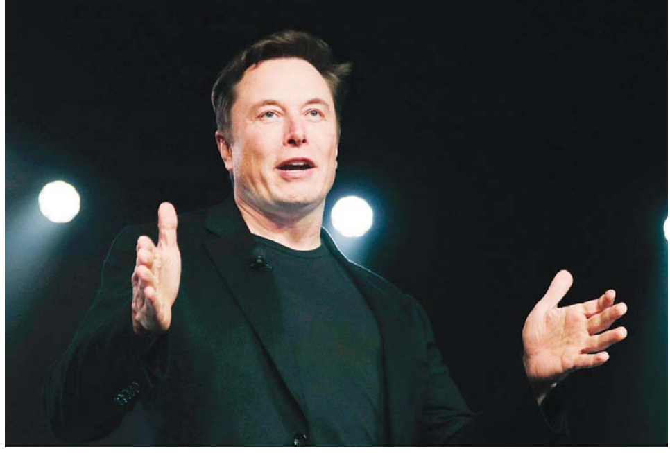
တက်စ်လာကုမ္ပဏီမှ စီအီးအို အီလွန်မက်စ်။

ထို့အပြင် ဗီယက်နမ်နိုင်ငံ၌ အောက်တိုဘာ ၅ ရက်အထိ ရောဂါ ပြင်းထန်ပြီး အသက်ရှူအထောက်အကူပြု ကိရိယာတပ်ဆင်ရန်လိုအပ်သူ ၇၅ ဦးရှိကြောင်း သိရသည်။ ဆင်ဟွာ