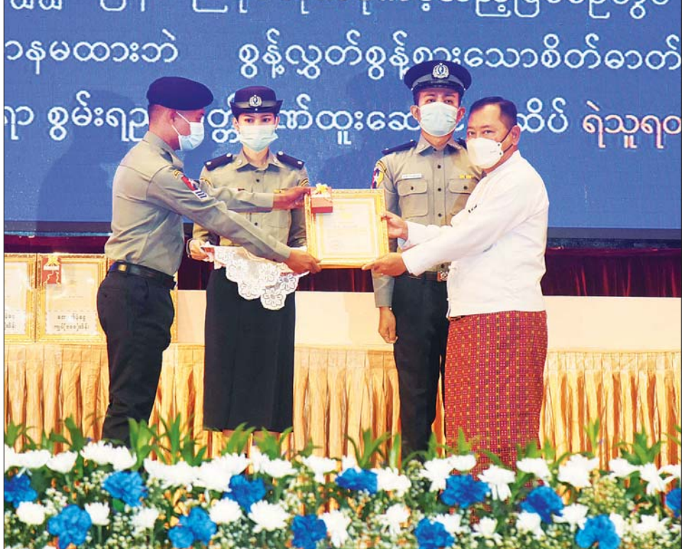
နိုင်ငံတော်စီမံအုပ်ချုပ်ရေးကောင်စီဝင် ပြည်ထဲရေးဝန်ကြီးဌာန ပြည်ထောင်စုဝန်ကြီး ဒုတိယဗိုလ်ချုပ် ကြီး စိုးထွဋ် စွမ်းရည်သတ္တိဂုဏ်ထူးဆောင်တံဆိပ်ရရှိသူ တစ်ဦးအား ဂုဏ်ထူးဆောင်တံဆိပ် ပေးအပ် ချီးမြှင့်စဉ်။

ထို့ပြင် မူးယစ်ဆေးဝါးထုတ်လုပ်သယ်ဆောင် ရောင်းဝယ်မှုနှင့် မူးယစ်ဆေးဝါး သယ်ဆောင်ရာလမ်း ကြောင်းများ ပြောင်းလဲမှုအပေါ်သုံးသပ်၍ ၂၀၂၂ ခုနှစ် အတွင်း မူးယစ်ဆေးဝါးတားဆီးနှိမ်နင်းရေး အထူး စစ်ဆင်ရေး နှစ်ကြိမ် ဆောင်ရွက်ခဲ့နိုင်ကြောင်း၊ မူးယစ်ဆေးဝါး ဖမ်းဆီးရမိမှုများကို ကြည့်မည်ဆိုပါ က ၂၀၂၁ ခုနှစ်အတွင်း တန်ဖိုးငွေကျပ် ၉၇၀ ဘီလီယံ ကျော် (အမေရိကန်ဒေါ်လာ ၆၀၆ ဒသမ ၄၃၀၆ သန်း) နှင့် ၂၀၂၂ ခုနှစ် ဇန်နဝါရီ ၁ ရက်မှ ဇူလိုင် ၁၀ ရက် အထိ ၆ လကျော်ကာလအတွင်း တန်ဖိုးငွေကျပ် ၇၀၈ ဘီလီယံကျော် (အမေရိကန် ဒေါ်လာ ၃၈၃ ဒသမ ၁၁၉ သန်း)ကို ဖမ်းဆီးအရေးယူနိုင်ခဲ့ခြင်းသည် မြန်မာနိုင်ငံရဲတပ်ဖွဲ့နှင့် မူးယစ်ဆေးဝါးနှင့် စိတ်ကို ပြောင်းလဲစေသော အဖွဲ့များ၏ လုပ်ဆောင်ချက်