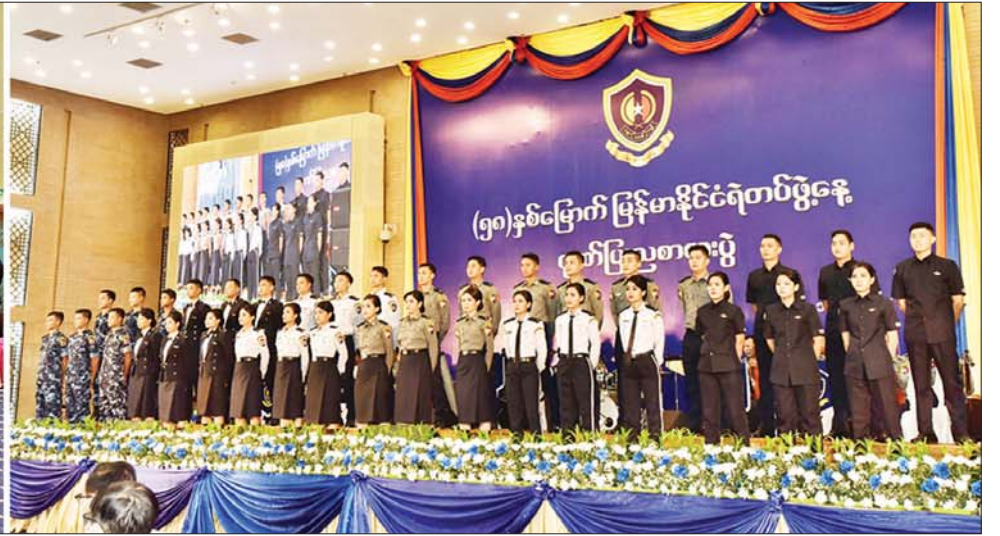
နိုင်ငံတော်စီမံအုပ်ချုပ်ရေးကောင်စီ ဒုတိယဥက္ကဋ္ဌ ဒုတိယဝန်ကြီးချုပ် ဒုတိယဗိုလ်ချုပ်မှူးကြီး စိုးဝင်း အခမ်းအနားသို့ တက်ရောက်လာကြသူများနှင့်အတူ မြန်မာနိုင်ငံရဲတပ်ဖွဲ့၊ ရဲတီးဝိုင်းနှင့် ဖျော်ဖြေရေးဌာနခွဲမှ တပ်ဖွဲ့ဝင်များက တေးသံသာများဖြင့် သီဆိုဖျော်ဖြေနေမှုကို ကြည့်ရှုအားပေးစဉ်။