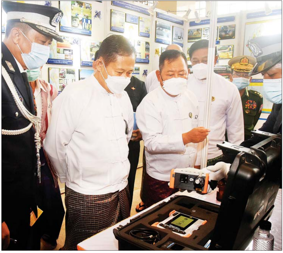
နိုင်ငံတော်စီမံအုပ်ချုပ်ရေးကောင်စီ ဒုတိယဥက္ကဋ္ဌ ဒုတိယဝန်ကြီးချုပ် ဒုတိယဗိုလ်ချုပ်မှူးကြီး စိုးဝင်း (၅၈) နှစ်မြောက် မြန်မာနိုင်ငံရဲ တပ်ဖွဲ့နေ့ အထိမ်းအမှတ် အခမ်းအနားတွင် ခင်းကျင်းပြသထားသည့် တပ်ဖွဲ့/ဌာနများတွင် အသုံးပြုသည့် စပွန်းကိရိယာများကို ကြည့်ရှုအားပေးစဉ်။

နိုင်ငံတော်၏ နိုင်ငံရေး၊ အုပ်ချုပ်ရေး၊ စီးပွားရေး၊ လူမှုရေး စသည့်ကဏ္ဍများ တိုးတက်ပြောင်းလဲလာ သည့်နှင့်အမျှ ဒေသဖွံ့ဖြိုးတိုးတက်ရေးနှင့် အုပ်ချုပ်ရေးဆိုင်ရာ လုပ်ငန်းများဆောင်ရွက်ရာတွင် ပိုမို အဆင်ပြေချောမွေ့စေရန် နေပြည်တော် ကောင်စီနယ်မြေ၊ တိုင်းဒေသကြီးနှင့် ပြည်နယ် ရဲတပ်ဖွဲ့များတွင် ခရိုင်အဆင့် ၄၆ ခုကို ထပ်မံတိုးချဲ့ ဖွဲ့စည်း ပေးနိုင်ခဲ့ကြောင်း၊ အသစ်ထပ်မံဖွဲ့စည်းထား သည့် ခရိုင်ရုံးများ အမြန်ဆုံးထိရောက်အောင်မြင်စွာ