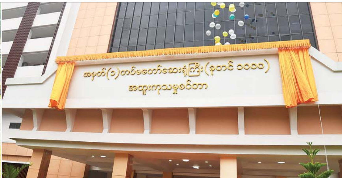
နိုင်ငံတော်စီမံအုပ်ချုပ်ရေးကောင်စီဥက္ကဋ္ဌ တပ်မတော်ကာကွယ်ရေးဦးစီးချုပ် ဗိုလ်ချုပ်မှူးကြီး မင်းအောင်လှိုင် အမှတ်(၁) တပ်မတော်ဆေးရုံကြီး (ခုတင်-၁၀၀၀)၊ အဆင့်မြင့် (၈)ထပ်ဆေးရုံအဆောက်အအုံသစ် အထူးကုသမှုစင်တာဆိုင်ဘုတ်ကို စက်ခလုတ်နှိပ် ဖွင့်လှစ်ပေးစဉ်။