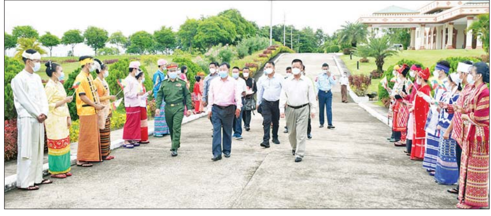
ငြိမ်းချမ်းရေးဆွေးနွေးဆောင်ရွက်ခဲ့သည့် အမျိုးသားဒီမိုကရက်တစ်မဟာမိတ်အဖွဲ့ (NDAA) ငြိမ်းချမ်းရေးကိုယ်စားလှယ်အဖွဲ့၊ နေပြည်တော်မှ ပြန်လည်ထွက်ခွာရာ တာဝန်ရှိသူများ နေပြည်တော်လေဆိပ်၌ ပို့ဆောင်နှုတ်ဆက်စဉ်။

ယဉ်ကျေးမှုဝန်ကြီးဌာန၊ အနုပညာဦးစီးဌာနမှ တိုင်းရင်းသား တိုင်းရင်းသူများ၊ ဌာနဆိုင်ရာ ဝန်ထမ်းများ၊ ငြိမ်းချမ်းရေးကို လိုလားသည့် ဒေသပြည်သူများက ထာဝရငြိမ်းချမ်းရေးကိုရရှိရေး သည် ပြည်သူတစ်ရပ်လုံး၏ ဆန္ဒအစစ်အမှန်ဖြစ်သည်။ ငြိမ်းချမ်းရေးရရှိရေးသည် နိုင်ငံသားအားလုံး၏ ဆန္ဒအမှန်ဖြစ်သည်။ ပြည်ထောင်စုကြီး ငြိမ်းချမ်းဖို့ တွေ့ဆုံဆွေးနွေးကြပါစို့။ တိုင်းရင်းသားတွေ စည်းလုံးမှု ငြိမ်းချမ်းတည်ငြိမ်အေးချမ်းရ စသည့် တိုင်းရင်းသားဘာသာနှင့် မြန်မာဘာသာစာသားပါ ဆိုင်းဘုတ်များ ကိုင်ဆောင်၍လည်းကောင်း၊ နိုင်ငံတော်အလံငယ်များ ကိုင်ဆောင်၍လည်းကောင်း Horizon Lake View Resort နှင့် နေပြည်တော် လေဆိပ်တို့၌ ပို့ဆောင်နှုတ်ဆက်ခဲ့ကြကြောင်း သိရသည်။