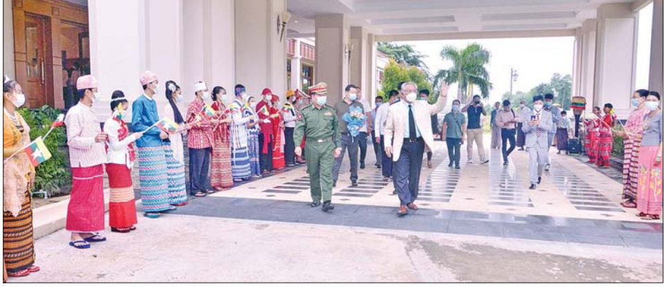
ငြိမ်းချမ်းရေးဆွေးနွေးဆောင်ရွက်ခဲ့သည့် “ဝ”ပြည်သွေးစည်းညီညွတ်ရေးပါတီ (UWSP) ငြိမ်းချမ်းရေးကိုယ်စားလှယ်အဖွဲ့၊ နေပြည်တော်မှ ပြန်လည်ထွက်ခွာရာ တာဝန်ရှိသူများ နေပြည်တော်လေဆိပ်၌ ပို့ဆောင်နှုတ်ဆက်စဉ်။

နေပြည်တော် အောက်တိုဘာ ၁ နိုင်ငံတော် စီမံအုပ်ချုပ်ရေး ကောင်စီဥက္ကဋ္ဌ နိုင်ငံတော်ဝန်ကြီးချုပ် ဗိုလ်ချုပ်မှူးကြီး မင်းအောင်လှိုင်၏ ငြိမ်းချမ်းရေးဆွေးနွေးရန် ဖိတ်ခေါ်ကမ်းလှမ်းမှုအရ နေပြည်တော်သို့ ရောက်ရှိပြီး ငြိမ်းချမ်းရေး ဆွေးနွေးဆောင်ရွက်ခဲ့သည့် “ဝ”ပြည်သွေးစည်းညီညွတ်ရေးပါတီ (UWSP) ဒုတိယဥက္ကဋ္ဌ ဦးလော့ယာက ဦးဆောင်သည့် ငြိမ်းချမ်းရေးကိုယ်စားလှယ်အဖွဲ့၊ ရှမ်းပြည်တိုးတက်ရေးပါတီ (SSPP) ဒုတိယဥက္ကဋ္ဌ(၂) စဝ်ခွန်ဆိုင် ဦးဆောင်သည့် ငြိမ်းချမ်းရေးကိုယ်စားလှယ်အဖွဲ့နှင့် အမျိုးသားဒီမိုကရက်တစ် မဟာမိတ်အဖွဲ့ (NDAA) ဒုတိယဥက္ကဋ္ဌ ဦးစန်ပေဦးဆောင်သည့် ငြိမ်းချမ်းရေးကိုယ်စားလှယ်အဖွဲ့တို့သည် ယနေ့နံနက်ပိုင်းတွင် နေပြည်တော်မှ ပြန်လည် ထွက်ခွာသွားကြသည်။