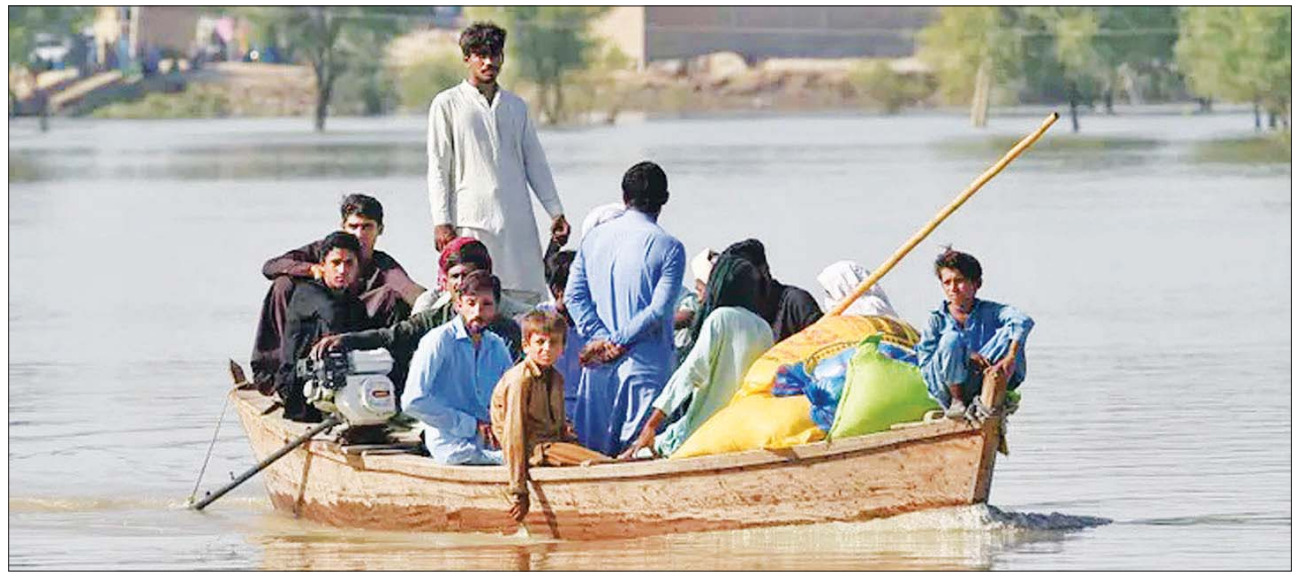
ပန်ဂျပ်ပြည်နယ်၌ ရေကြီးမှုကြောင့် နေရပ်သို့ လှေဖြင့်သွားလာနေသည့် ဒေသခံများကို တွေ့ရစဉ်။