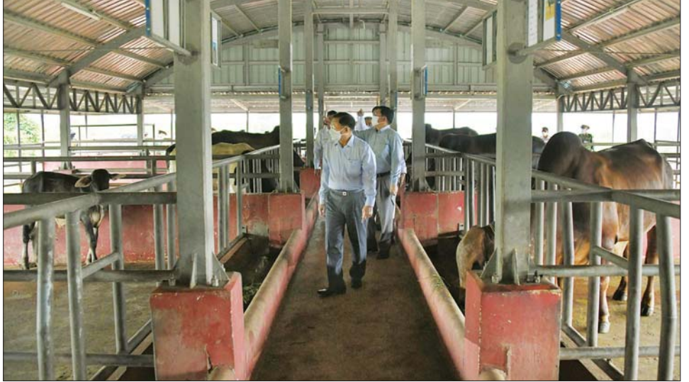
နိုင်ငံတော်စီမံအုပ်ချုပ်ရေးကောင်စီဥက္ကဋ္ဌ နိုင်ငံတော်ဝန်ကြီးချုပ် ဗိုလ်ချုပ်မှူးကြီး မင်းအောင်လှိုင် (၂၆) မိုင် ဘက်စုံစိုက်ပျိုးမွေးမြူရေးဇုန်အတွင်း ကြည့်ရှုစစ်ဆေးစဉ်။