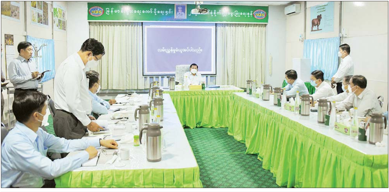
နိုင်ငံတော်စီမံအုပ်ချုပ်ရေးကောင်စီဥက္ကဋ္ဌ နိုင်ငံတော်ဝန်ကြီးချုပ် ဗိုလ်ချုပ်မှူးကြီး မင်းအောင်လှိုင် အား (၂၆) မိုင် ဘက်စုံစိုက်ပျိုးမွေးမြူရေးဇုန် အကောင်အထည်ဖော်ဆောင်ရွက်ထားရှိမှု အခြေအနေများနှင့်ပတ်သက်ပြီး တာဝန်ရှိသူတစ်ဦးက ရှင်းလင်းတင်ပြစဉ်။

နေပြည်တော် အောက်တိုဘာ ၁ နိုင်ငံတော်စီမံအုပ်ချုပ်ရေးကောင်စီ ဥက္ကဋ္ဌ နိုင်ငံတော်ဝန်ကြီးချုပ် ဗိုလ်ချုပ်မှူးကြီး မင်းအောင်လှိုင် သည် ကောင်စီတွဲဖက်အတွင်း ရေးမှူး ဒုတိယဗိုလ်ချုပ်ကြီး ရဲဝင်းဦး၊ ပြည်ထောင်စုဝန်ကြီးများ ဖြစ်ကြသည့် ဦးတင်ထွဋ်ဦး၊ ဦးလှမိုး၊ ညိုနှိုင်းကွပ်ကဲရေးမှူး (ကြည်း၊ ရေ၊ လေ) ဗိုလ်ချုပ်ကြီး မောင်မောင်အေး၊ ကာကွယ်ရေး ဦးစီးချုပ်ရုံးမှ တပ်မတော်အရာရှိ ကြီးများ၊ ရန်ကုန်တိုင်းဒေသကြီး ဝန်ကြီးချုပ် ဦးစိုးသိန်း၊ ရန်ကုန် တိုင်းစစ်ဌာနချုပ် တိုင်းမှူး ဗိုလ်ချုပ် ညွှန်ကြားရေးမှူး ဦးဗိုလ်ဌေးနှင့် တာဝန်ရှိသူများ လိုက်ပါ၍ ရန်ကုန် - မန္တလေး အမြန်လမ်းမကြီးအနီးရှိ မြန်မာ စီးပွားရေးကော်ပိုရေးရှင်း (၂၆)မိုင် ဘက်စုံ စိုက်ပျိုးမွေးမြူရေးဇုန် အကောင်အထည်ဖော် ဆောင်ရွက်ထားရှိမှု အခြေအနေများကို သွားရောက်ကြည့်ရှု စစ်ဆေး သည်။