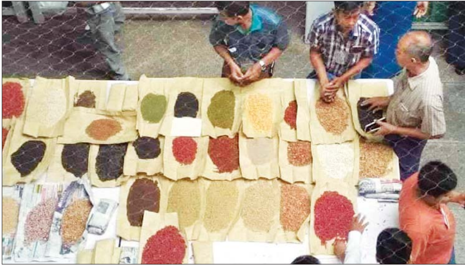
မန္တလေးကုန်စည်ခိုင်၌ ပဲအရောင်းအဝယ်လုပ်နေသည့် ကုန်သည်ပွဲစားများ။

မန္တလေး အောက်တိုဘာ ၁ ယခုရက်ပိုင်းအတွင်း မန္တလေးဈေးကွက်ထဲသို့ မြေပဲဆန်အသစ်များ လှိုင်လှိုင်ဝင်ရောက်လာသဖြင့် ပြည်တွင်းစားသုံးနေသည့် ပဲဆီဈေးနှုန်းသည် တစ်ပိဿာလျှင် ကျပ် ၁၁၀၀၀ ဈေးအထိ လျော့နည်းကျဆင်းလာကြောင်း မန္တလေးပဲကုန်သည်များထံမှ သိရသည်။