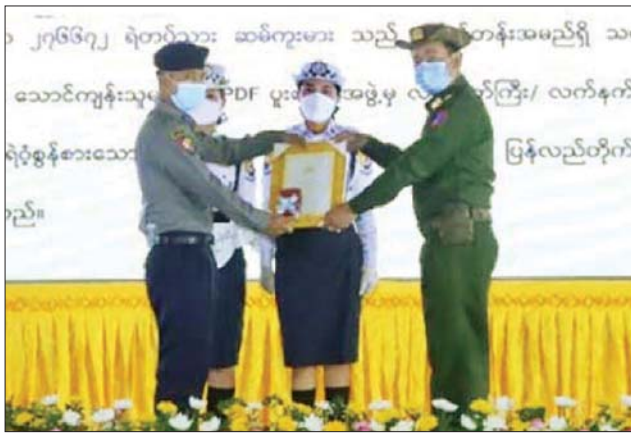
ဂုဏ်ပြု မှတ်တမ်းလွှာများနှင့် အမှတ် Video Clip နှင့် ခင်းကျင်း ဂုဏ်ပြုဆုငွေများ ပေးအပ်ချီးမြှင့် ပြသထားသော ပြခန်းများကို ကြည့်ရှု(အပေါ်ပုံ)ရဲတပ်ဖွဲ့နေ့ အထိမ်း လိုက်လံကြည့်ရှုသည်။ သတင်းစဉ်

ဦးစွာ တိုင်းဒေသကြီးနှင့် ပြည်နယ်ဝန်ကြီးချုပ်များက ဂုဏ်ပြုအမှာစကား ပြောကြားသည်။ ထို့နောက် တာဝန်ရှိသူများက မြန်မာနိုင်ငံရဲတပ်ဖွဲ့ ရဲချုပ်မှ ပေးပို့သည့် သဝဏ်လွှာကို ဖတ်ကြားကြသည်။ ဆက်လက်၍ တိုင်းဒေသကြီးနှင့် ပြည်နယ် ဝန်ကြီးချုပ်များ၊ တိုင်းမှူးများနှင့် တာဝန်ရှိသူများက မြန်မာနိုင်ငံရဲတပ်ဖွဲ့ဆိုင်ရာ ဂုဏ်ထူးဆောင် ဆုတံဆိပ်ရရှိသူများအား ဂုဏ်ပြုဆုတံဆိပ်