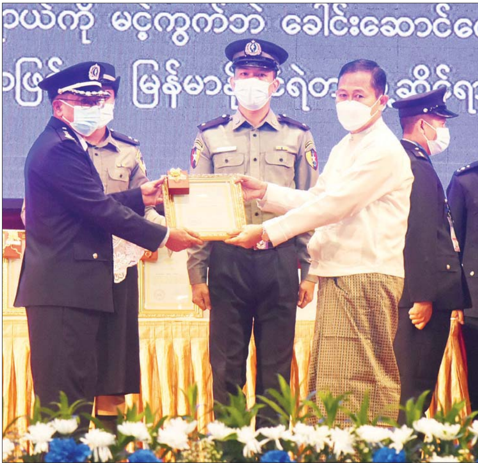
နိုင်ငံတော်စီမံအုပ်ချုပ်ရေးကောင်စီ ဒုတိယဥက္ကဋ္ဌ ဒုတိယဝန်ကြီးချုပ် ဒုတိယဗိုလ်ချုပ်မှူးကြီး စိုးဝင်း စွမ်းရည်သတ္တိ ဂုဏ်ထူးဆောင် တံဆိပ်ရရှိသူ တစ်ဦးအား ဂုဏ်ထူးဆောင်တံဆိပ် ပေးအပ်ချီးမြှင့်စဉ်။

အာဆီယံအဖွဲ့က ချမှတ်ပေးသော ဘေးကင်း လုံခြုံသည့် လူမှုအဖွဲ့အစည်းဖြစ်စေရေး၊ မူးယစ် ဆေးဝါးဆန့်ကျင်ရေး အာဆီယံလုပ်ငန်းစီမံချက် (၂၀၁၆-၂၀၂၅)တို့၌လည်း ပွင့်လင်းမြင်သာစွာ ပူးပေါင်း ဆောင်ရွက်လျက်ရှိကြောင်း၊ နိုင်ငံတကာနှင့် ပူးပေါင်းဆောင်ရွက်မှုအဖြစ် မြန်မာနိုင်ငံသည် မူးယစ်ဆေးဝါးပူးပေါင်းထိန်းချုပ်နိုင်ရန် အမေရိကန်၊ ဘင်္ဂလားဒေ့ရှ်၊ တရုတ်၊ အိန္ဒိယ၊ ကိုရီးယား၊ လာအို၊ ဖိလစ်ပိုင်၊ ရုရှား၊ ထိုင်း၊ ဗီယက်နမ်နိုင်ငံတို့နှင့် နှစ်နိုင်ငံ သဘောတူညီချက်များ (LOA)၊ နားလည်မှုစာချုပ်များ (MoU) လက်မှတ်ရေးထိုးထားပြီး ကုလသမဂ္ဂ ဆိုင်ရာ အစိုးရမဟုတ်သော အဖွဲ့အစည်းများ၊ ပြည်တွင်းအခြေစိုက် နိုင်ငံတကာအဖွဲ့အစည်းများ၊ အာဆီယံအဖွဲ့ဝင်နိုင်ငံများနှင့် အိမ်နီးချင်းနိုင်ငံများ အပါအဝင် နိုင်ငံကြီးအချို့နှင့်လည်း မူးယစ်ဆေးဝါး ပူးပေါင်းထိန်းချုပ်ရေးလုပ်ငန်းများကို အပြန်အလှန် နားလည်မှု၊ ယုံကြည်မှု၊ လေးစားမှုများကိုအခြေခံ လျက် တက်ကြွစွာ ပူးပေါင်းဆောင်ရွက်လျက်ရှိ ကြောင်း၊ မြန်မာနိုင်ငံရဲတပ်ဖွဲ့၏ လုပ်ငန်းတာဝန်များ အနက်မှ လုပ်ဆောင်ချက်တစ်ရပ်ကိုလည်း အခမ်း အနားသို့ တက်ရောက်လာကြသည့် ဧည့်သည် တော်ကြီးများနှင့် နိုင်ငံသူ၊ နိုင်ငံသားများအားလုံးသို့ အသိပေးပြောကြားလိုကြောင်း။