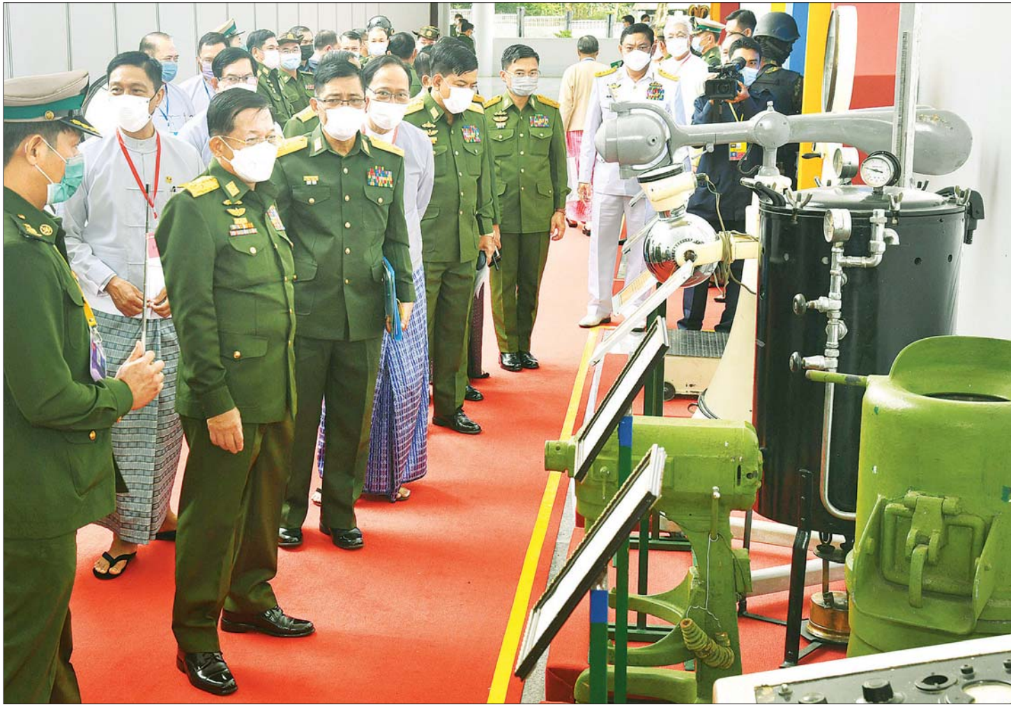
နိုင်ငံတော်စီမံအုပ်ချုပ်ရေးကောင်စီဥက္ကဋ္ဌ တပ်မတော်ကာကွယ်ရေးဦးစီးချုပ် ဗိုလ်ချုပ်မှူးကြီး မင်းအောင်လှိုင် (၇၅) နှစ်မြောက် စိန်ရတုဆေးဝန်ထမ်းတပ်ဖွဲ့နေ့ အထိမ်းအမှတ်ပြခန်းအတွင်း ကြည့်ရှုလေ့လာစဉ်။

သာကေများစွာ တွေ့မြင်ကြရမည်ဖြစ်ပါကြောင်း။ တပ်မတော်၏ စစ်ဆင်ရေးများဖြစ်သည့် အင်းစိန်တိုက်ပွဲ၊ တရုတ်ဖြူကျူးကျော်မှုမှစ၍ စစ်ဆင်ရေးများအထိ တိုက်ပွဲပေါင်း၊ စစ်ဆင်ရေးပေါင်းများစွာလည်း ဆေးဝန်ထမ်းတပ်ဖွဲ့ဝင်များသည် စွမ်းစွမ်းတမ်းကျော်ပွန်စွာ တာဝန်ထမ်းဆောင်ခဲ့ကြသည်ကို မြင်တွေ့ခဲ့ကြရမည်ဖြစ်ကြောင်း၊ ထိုကဲ့သို့ စစ်ဆင်ရေးတာဝန်များကို ထမ်းဆောင်ခဲ့ကြရာတွင် ဗိုလ်ကြီး သူရမ္မန်ထော်သက်ညွန့်ကဲ့သို့ တိုင်းပြည်အတွက် စွန့်လွှတ်စွန့်စား ဆောင်ရွက်ခဲ့ကြသည့် ထူးချွန်သူပေါင်းများစွာကိုလည်း ဆေးဝန်ထမ်းတပ်ဖွဲ့သမိုင်းတစ်လျှောက်တွင် များစွာတွေ့မြင်ခဲ့ရပြီး ဖြစ်ပါကြောင်း။