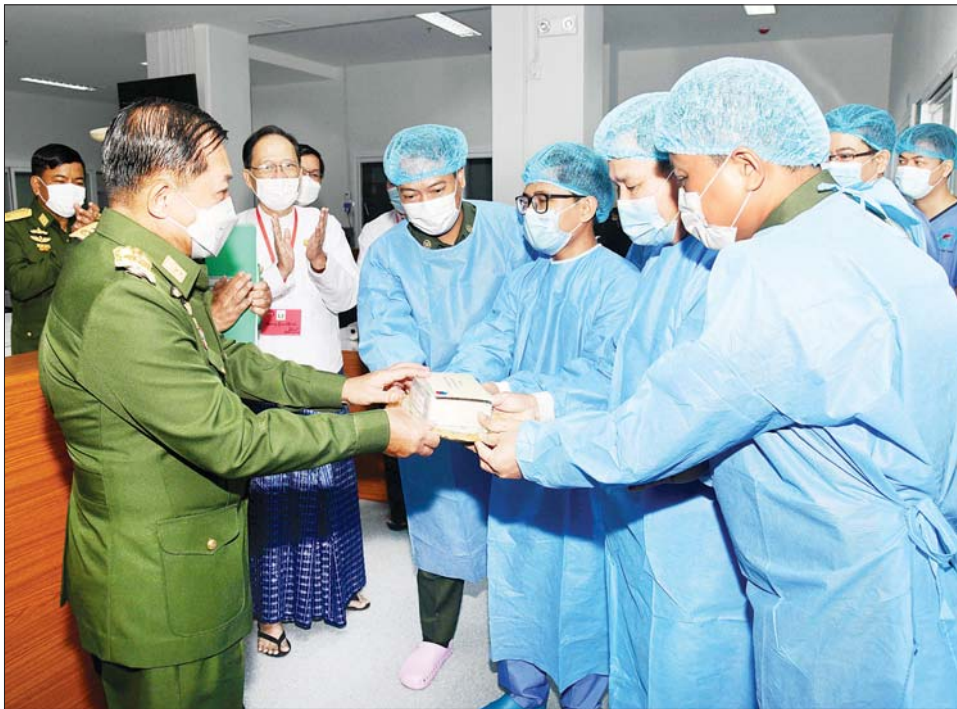
နိုင်ငံတော်စီမံအုပ်ချုပ်ရေးကောင်စီဥက္ကဋ္ဌ တပ်မတော်ကာကွယ်ရေးဦးစီးချုပ် ဗိုလ်ချုပ်မှူးကြီး မင်းအောင်လှိုင် အသည်းအစားထိုးခဲ့စိတ်ကုသမှုကို အောင်မြင်စွာဆောင်ရွက်နိုင်ခဲ့ကြသည့် တပ်မတော်မှ ပါရဂူကြီးများနှင့် ဆေးမှူးများအတွက် ဂုဏ်ပြုချီးမြှင့်ငွေများ ပေးအပ်စဉ်။

ဆေးဝန်ထမ်းတပ်ဖွဲ့အနေဖြင့် တပ်ဖွဲ့အတွင်း ပညာရပ်ပိုင်းဆိုင်ရာ ဖွံ့ဖြိုးတိုးတက်ရေး ဆောင်ရွက် လျက်ရှိသည့်နည်းတူ နိုင်ငံတကာနှင့် ပူးပေါင်းဆောင် ရွက်ပြီး ပညာရပ်ပိုင်းဆိုင်ရာ အတွေ့အကြုံများ၊ နည်းပညာများ မြှင့်မားလာစေရေး ဆောင်ရွက်လျက် ရှိသည်ကိုလည်း တွေ့ရမည်ဖြစ်ပါကြောင်း၊ ထိုကဲ့သို့ ဆောင်ရွက်သည့်အခါတွင် အာဆီယံအပါအဝင် နိုင်ငံတကာအဖွဲ့အစည်းများနှင့် အင်တိုက်အားတိုက် ပူးပေါင်းဆောင်ရွက်နေကြောင်း၊ ထို့အပြင် အပြည် ပြည်ဆိုင်ရာ စစ်ဘက်ဆေးတက္ကသိုလ်များညီလာခံ (International Conference of Military Medical Schools - ICMMS) နှင့် နိုင်ငံတကာစစ်ဘက် ဆေးပညာဆိုင်ရာကော်မတီ (International Committee of Military Medicine - ICMM) များသို့လည်း တက်ရောက်ပြီး နိုင်ငံတကာရှိ စစ်ဘက် ဆေးပညာ ဖွံ့ဖြိုးတိုးတက်မှုများနှင့် စဉ်ဆက်မပြတ် ရေး ရည်မှန်းကြိုးပမ်း ဆောင်ရွက်လျက်ရှိသည်ကို လည်း မြင်တွေ့ကြရမည်ဖြစ်ပါကြောင်း၊ နိုင်ငံတကာ တွင်ရှိသည့် ဆေးတပ်ဖွဲ့များနှင့် ချစ်ကြည်ရင်းနှီးမှုများ ရရှိလာစေရန်အတွက် ရုရှားနိုင်ငံတွင် နှစ်စဉ်ကျင်းပ