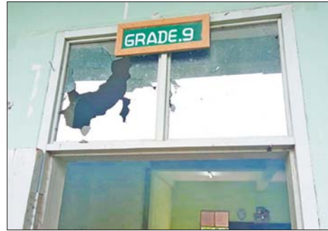
မြင်းခြံမြို့နယ် မြောက်ကျွန်းကျေးရွာရှိ အခြေခံပညာအထက်တန်းကျောင်းခွဲအား အကြမ်းဖက်သမားများ ပစ်ခတ်မှုကြောင့် ပျက်စီးမှုမှတ်တမ်းဓာတ်ပုံ။