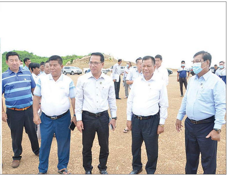
ပြည်ထောင်စုဝန်ကြီး ဦးမောင်မောင်အုန်း၊ ပြည်ထောင်စုဝန်ကြီး ဦးသောင်းဟန်၊ မန္တလေးတိုင်းဒေသကြီးဝန်ကြီးချုပ် ဦးမောင်ကိုနှင့် မန္တလေးစက်မှုဇုန်မှ လုပ်ငန်းရှင်များ တောင်တော်ကွင်း နေရောင်ခြည်စွမ်းအင်သုံးဓာတ်အားထုတ်လုပ်ရေးစီမံကိန်းကို ကြည့်ရှုလေ့လာစဉ်။

ရှေးဦးစွာ ပြည်ထောင်စုဝန်ကြီးများ၊ မန္တလေးတိုင်းဒေသကြီးဝန်ကြီးချုပ်နှင့် မန္တလေးစက်မှုဇုန်မှ လုပ်ငန်းရှင်များသည် နံနက်ပိုင်းတွင် တောင်တော်ကွင်း နေရောင်ခြည်စွမ်းအင်သုံး ဓာတ်အားထုတ်လုပ်ရေး စက်ရုံသို့ ရောက်ရှိကြရာ ရှင်းလင်းဆောင်၍ လျှပ်စစ်စွမ်းအားဝန်ကြီးဌာန ပြည်ထောင်စုဝန်ကြီးက နိုင်ငံတော်ဝန်ကြီးချုပ်အနေဖြင့် နိုင်ငံစီးပွား ဖွံ့ဖြိုးတိုးတက်စေရန်အတွက် အသေးစား၊ အငယ်စားနှင့် အလတ်စားစက်မှုလုပ်ငန်း (MSME) များကို အားပေးဆောင်ရွက်လျက်ရှိရာ စက်မှုဇုန်များအတွက် အရေးကြီးသော လျှပ်စစ်ဓာတ်အား ရရှိရေးကို မိမိတို့ဝန်ကြီးဌာန အနေဖြင့် ကြိုးပမ်းထုတ်လုပ်ပေးလျက်ရှိပါကြောင်း၊ စက်မှုဇုန်များ လိုအပ်ချက်အတိုင်း လျှပ်စစ်ဓာတ်အား အပြည့်အဝ ရရှိရန်မှာ ကန့်သတ်ချက်များ ရှိနိုင်သဖြင့် ပုဂ္ဂလိကပိုင်းမှ လျှပ်စစ်ဓာတ်အားထုတ်လုပ်မှု နေရောင်ခြည်စွမ်းအင်သုံး ဓာတ်အားထုတ်လုပ်မှုတို့ကို လေ့လာသိရှိပြီး ပါဝင်ဆောင်ရွက်နိုင်ရန်အတွက် မန္တလေးတိုင်းဒေသကြီး ဝန်ကြီးချုပ်နှင့် ညှိနှိုင်း၍ ယခုလို စီစဉ်ဆောင်ရွက်ခြင်း ဖြစ်ပါကြောင်း၊ စက်မှုဇုန်တွင် စုပေါင်း၍ဖြစ်စေ၊ တစ်ဦးချင်း ဖြစ်စေ အခြေအနေအပေါ် မူတည်ပြီး နေရောင်ခြည်စွမ်းအင်သုံး