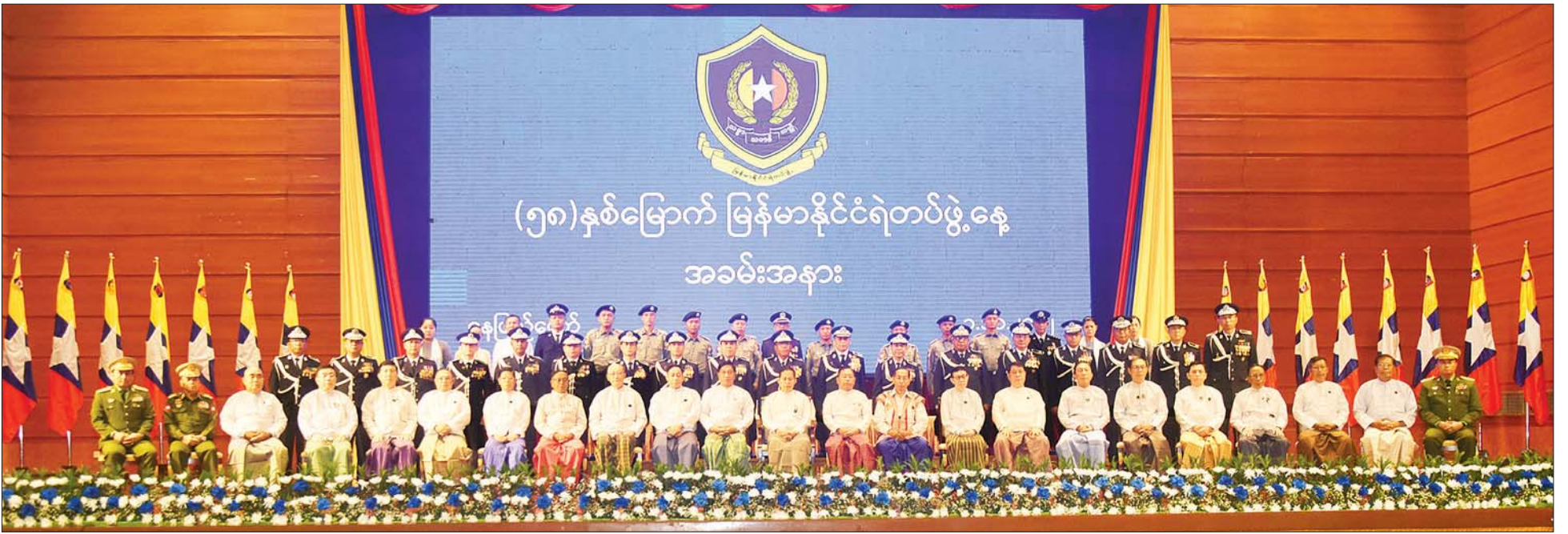
နိုင်ငံတော်စီမံအုပ်ချုပ်ရေးကောင်စီ ဒုတိယဥက္ကဋ္ဌ ဒုတိယဝန်ကြီးချုပ် ဒုတိယဗိုလ်ချုပ်မှူးကြီး စိုးဝင်း အခမ်းအနားသို့ တက်ရောက်လာကြသူများနှင့်အတူ မှတ်တမ်းတင်ဓာတ်ပုံရိုက်စဉ်။