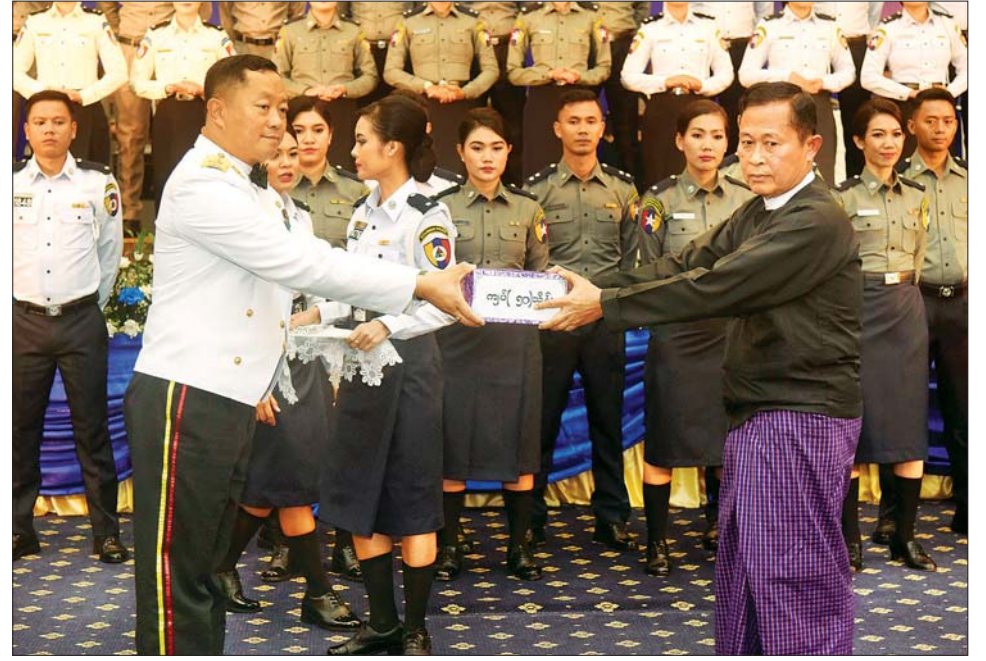
ဝင် ပြည်ထဲရေးဝန်ကြီးဌာန ပြည်ထောင်စုဝန်ကြီး ဒုတိယဗိုလ်ချုပ်ကြီး စိုးထွဋ်နှင့် ဇနီးက ဂုဏ်ပြုပန်းခြင်းနှင့် ဂုဏ်ပြုဆုဇွဲများကိုပေးအပ်ရာ တာဝန်ရှိသူများက လက်ခံရယူခဲ့ကြောင်း သတင်းရရှိသည်။

(၅၈) နှစ်မြောက် မြန်မာနိုင်ငံရဲတပ်ဖွဲ့နေ့ အထိမ်းအမှတ်ဂုဏ်ပြုညစာ သုံးဆောင်မိန့်နှင့် သုံးဆောင်နေစဉ်အတွင်း မြန်မာနိုင်ငံရဲတပ်ဖွဲ့၊ ရဲတီးဝိုင်းနှင့် ဖျော်ဖြေရေးဌာနခွဲမှ တပ်ဖွဲ့ဝင်များက တေးသံသာများဖြင့် သီဆိုဖျော်ဖြေကြသည်။ ဂုဏ်ပြုဆုဇွဲများ ပေးအပ် ဂုဏ်ပြုညစာသုံးဆောင်အပြီးတွင် သီဆိုတီးမှုတ်ဖျော်ဖြေခဲ့ကြသည့် မြန်မာနိုင်ငံရဲ တပ်ဖွဲ့၊ ရဲတီးဝိုင်းနှင့်ဖျော်ဖြေရေးဌာနခွဲအား နိုင်ငံတော်စီမံအုပ်ချုပ်ရေးကောင်စီ ဒုတိယဥက္ကဋ္ဌ ဒုတိယဝန်ကြီးချုပ် ဒုတိယဗိုလ်ချုပ်မှူးကြီး စိုးဝင်းက တပ်မတော် (ကြည်း၊ ရေ၊ လေ) မိသားစုများကိုယ်စား ဂုဏ်ပြုဆုဇွဲကျပ် သိန်း ၅၀ ကို ပေးအပ်ရာ ပြည်ထဲရေးဝန်ကြီးဌာန ဒုတိယဝန်ကြီး မြန်မာနိုင်ငံရဲတပ်ဖွဲ့၊ ရဲချုပ်က လက်ခံရယူသည်။ (ယာပုံ) ထို့နောက် နိုင်ငံတော်စီမံအုပ်ချုပ်ရေးကောင်စီ