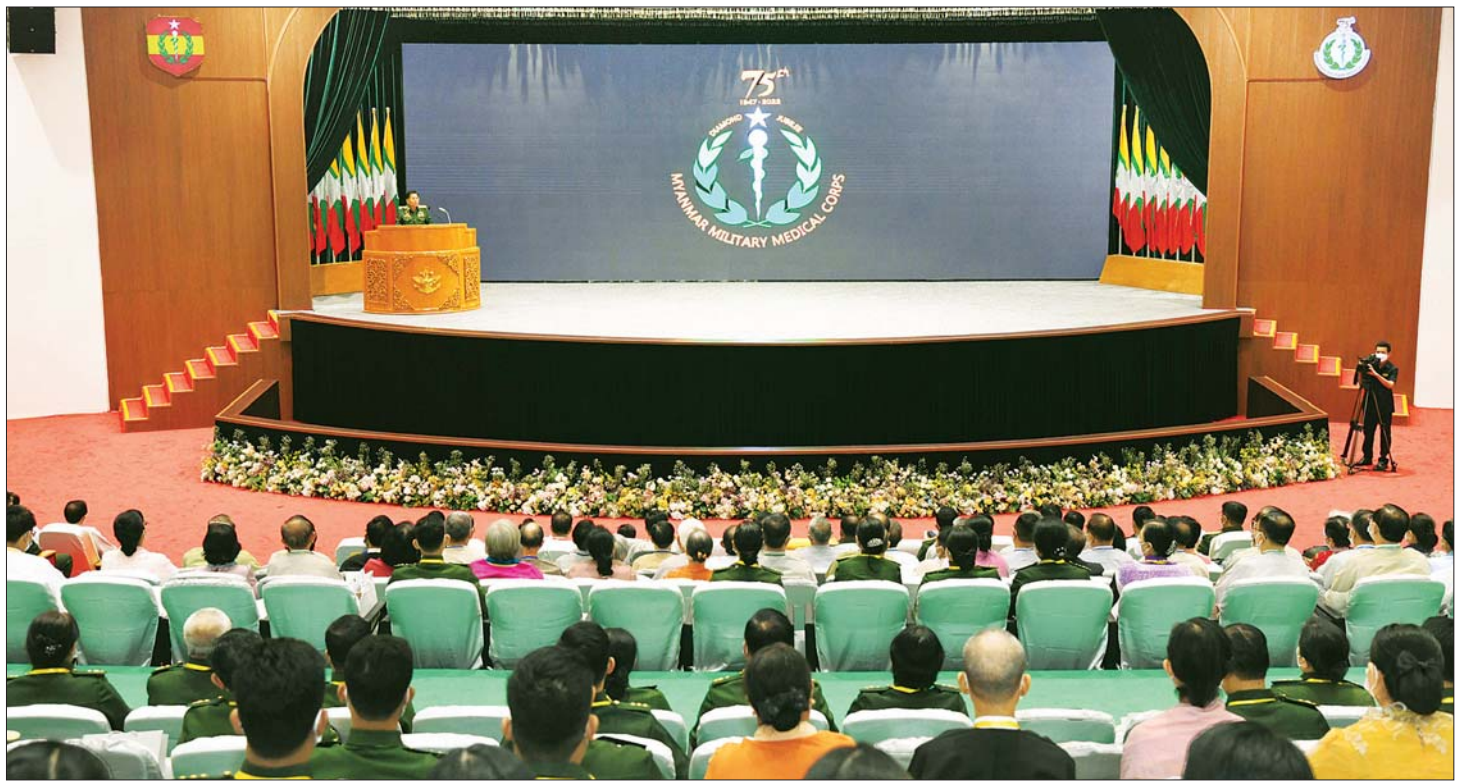
နိုင်ငံတော်စီမံအုပ်ချုပ်ရေးကောင်စီဥက္ကဋ္ဌ တပ်မတော်ကာကွယ်ရေးဦးစီးချုပ် ဗိုလ်ချုပ်မှူးကြီး မင်းအောင်လှိုင် (၇၅)နှစ်မြောက် စိန်ရတုဆေးဝန်ထမ်းတပ်ဖွဲ့နေ့ အထိမ်းအမှတ်အခမ်းအနားတွင် ဂုဏ်ပြုအမှာစကားပြောကြားစဉ်။

ထို့နောက် ဘွဲ့နှင့်သဘင်ခန်းမအတွင်း၌ (၇၅) နှစ်မြောက် စိန်ရတုဆေးဝန်ထမ်း တပ်ဖွဲ့နေ့အထိမ်းအမှတ်အဖြစ် နိုင်ငံတော်စီမံအုပ်ချုပ်ရေးကောင်စီ ဥက္ကဋ္ဌ တပ်မတော်ကာကွယ်ရေးဦးစီးချုပ်က ဂုဏ်ပြု အမှာစကားပြောကြားရာတွင် ယနေ့သည် လွတ်လပ်ရေးကြိုးပမ်းမှုကာလကတည်းက မြန်မာ့တပ်မတော်နှင့်အတူ ပေါက်ဖွားလာခဲ့ပြီး သမိုင်းအစဉ်အလာကြီးမားစွာ ရပ်တည်လာခဲ့သည့် တပ်မတော်ဆေးဝန်ထမ်းတပ်ဖွဲ့၏ (၇၅) နှစ်မြောက် စိန်ရတု