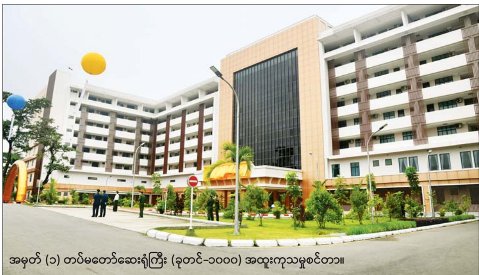
အမှတ် (၁) တပ်မတော်ဆေးရုံကြီး (ခုတင်-၁၀၀၀) အထူးကုသမှုစင်တာ။