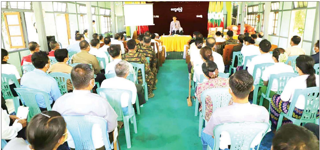
တိုင်းမှူးနှင့် တာဝန်ရှိသူများသည် ကလေးမြို့ မြို့နယ်စီမံအုပ်ချုပ်ရေး အဖွဲ့ရုံးရှိ အစည်းအဝေးခန်းမ၌ ဌာနဆိုင်ရာတာဝန်ရှိသူများ၊ မြို့မိမြို့ဖ များ၊ ဒေသခံပြည်သူများကို တွေ့ဆုံအမှာစကား ပြောကြားသည်။ ယင်းနောက် ကလေးမြို့နယ်စီမံအုပ်ချုပ်ရေးအဖွဲ့ဥက္ကဋ္ဌက နယ်မြေ

ထို့နောက် ပြည်ထောင်စုဝန်ကြီး၊ တိုင်းဒေသကြီး ဝန်ကြီးချုပ်၊