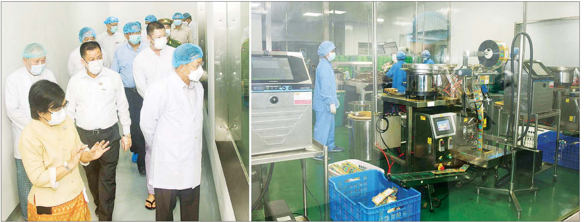
နိုင်ငံတော်စီမံအုပ်ချုပ်ရေးကောင်စီဥက္ကဋ္ဌ နိုင်ငံတော်ဝန်ကြီးချုပ် ဗိုလ်ချုပ်မှူးကြီး မင်းအောင်လှိုင်နှင့်အဖွဲ့ဝင်များ မောရိယတိုင်းရင်းဆေးထုတ်လုပ်ရေးလုပ်ငန်း စက်ရုံအတွင်း ဆေးဝါးများ ထုတ်လုပ်နေမှုကို ကြည့်ရှုလေ့လာစဉ်။