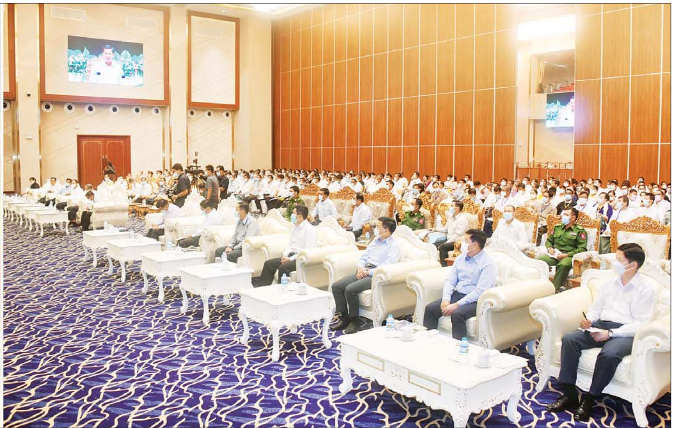
နိုင်ငံတော်စီမံအုပ်ချုပ်ရေးကောင်စီဥက္ကဋ္ဌ နိုင်ငံတော်ဝန်ကြီးချုပ် ဗိုလ်ချုပ်မှူးကြီး မင်းအောင်လှိုင် မန္တလေးစက်မှုဇုန်အတွင်းရှိ အသေးစား၊ အငယ်စားနှင့် အလတ်စားစီးပွားရေး (MSME) လုပ်ငန်းရှင်များအား တွေ့ဆုံအမှာစကားပြောကြားစဉ်။