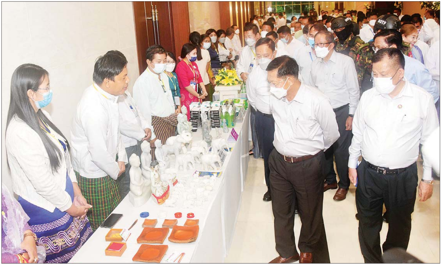
နိုင်ငံတော်စီမံအုပ်ချုပ်ရေးကောင်စီဥက္ကဋ္ဌ နိုင်ငံတော်ဝန်ကြီးချုပ် ဗိုလ်ချုပ်မှူးကြီး မင်းအောင်လှိုင် မန္တလေးစက်မှုဇုန်အတွင်းမှ ထုတ်လုပ်ထားသည့် လက်မှုထုတ်ကုန်ပစ္စည်းများကို လေ့လာကြည့်ရှုစဉ်။

လောင်စာဆီများ၊ သဘာဝဓာတ်ငွေ့များနှင့် ပတ်သက်၍ မိမိတို့နိုင်ငံတွင် စက်သုံးဆီများကို နှစ်စဉ် အမေရိကန်ဒေါ်လာ ၂ ဘီလီယံဖိုးခန့် တင်သွင်းနေရကြောင်း၊ မိမိတို့နိုင်ငံတွင် ကုန်းတွင်း ရေနံထုတ်လုပ်နိုင်သည့် အရင်းအမြစ်များ များစွာ ရှိနေသည့်အပြင် သဘာဝဓာတ်ငွေ့နှင့်ပတ်သက်၍ လည်း ကမ်းလွန်တွင် ထုတ်လုပ်၍ရသည့် အရင်း အမြစ်များ တွေ့ရှိထားပြီးဖြစ်ကြောင်း၊ ဒီဇယ်ဆီ တင်သွင်းခြင်းကို လျှော့ချနိုင်ရန်အတွက် လျှပ်စစ် အစားထိုး အသုံးပြုနိုင်သည့် စက်ကိရိယာများကို ပြောင်းလဲအသုံးပြုရမည်ဖြစ်ကြောင်း၊ ပို့ဆောင်ရေး စနစ်များတွင် လျှပ်စစ်ဓာတ်အားကို အသုံးပြုနိုင်ရေး အတွက် နိုင်ငံတော်အနေဖြင့် ကြိုးပမ်းဆောင်ရွက် လျက်ရှိပြီး ပြည်ပရင်းနှီးမြှုပ်နှံမှုများနှင့်လည်း သဘောတူညီချက်များ ရရှိထားပြီးဖြစ်ကြောင်း၊ လျှပ်စစ်စွမ်းအင်သုံးရထားများနှင့် ဘတ်စ်ကား များကို Public Transportation ကဏ္ဍတွင် ဦးစားပေးပြီးဆွဲနိုင်ရေး ရည်မှန်းဆောင်ရွက်လျက် ရှိကြောင်း၊ မိမိတို့နိုင်ငံတွင် မော်တော်ဆိုင်ကယ် အစီးရေ ၆ သန်းခန့်ရှိကြောင်း၊ နေ့စဉ် ဆီသုံးစွဲမှုများ ကို လျှော့ချနိုင်မည်ဆိုပါက ပြည်ပမှ စက်သုံးဆီ တင်သွင်းမှုများကို လျှော့ချနိုင်မည်ဖြစ်ကြောင်း၊ ထို့ကြောင့် အများပြည်သူ သယ်ယူပို့ဆောင်ရေးစနစ် များကို အားပေးဆောင်ရွက်ရမည်ဖြစ်ကြောင်း၊ သယ်ယူပို့ဆောင်ရေးလုပ်ငန်းများအတွက် လိုအပ် သည့် လျှပ်စစ်ဓာတ်အားများရရှိရေးအတွက်