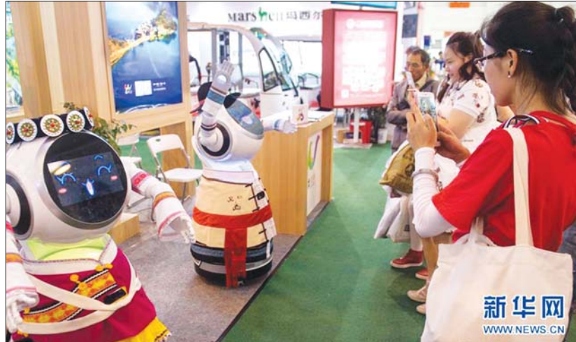
ပြီးခဲ့သည့် (၅) ကြိမ်မြောက် တရုတ်-တောင်အာရှကုန်စည်ပြပွဲမှ ပြခန်းတစ်ခု။

အွန်လိုင်းပြပွဲကိုလည်း www.csa-expo.com မှတစ်ဆင့် တစ်ပြိုင်တည်းကျင်းပ မည်ဖြစ်သည့်အပြင် ၂၀၂၂ GMS စီးပွားရေး စင်္ကြံအုပ်ချုပ်ရေးမှူးများဖိုရမ်၊ (၃) ကြိမ် မြောက် တရုတ် - တောင်အာရှ ပူးပေါင်း ဆောင်ရွက်ရေး ဖိုရမ်၊ (၁၀) ကြိမ်မြောက် ယူနန် - တိုင်ပေ စီးပွားရေး၊ ကုန်သွယ်ရေးနှင့် ယဉ်ကျေးမှု ညီလာခံအပါအဝင် ဖိုရမ်များ နှင့် တိုက်ရိုက်ထုတ်လွှင့်မှုလှုပ်ရှားမှုများ၊ (၁၅) ကြိမ်မြောက် တရုတ် - တောင်အာရှ စီးပွားရေးဖိုရမ်နှင့် (၁၈) ကြိမ်မြောက် အာဆီယံနိုင်ငံရပ်ခြား တရုတ်လုပ်ငန်းရှင်များ ညီလာခံကိုလည်း အွန်လိုင်းနှင့် အော့ဖ်လိုင်း တစ်ပြိုင်တည်း ကျင်းပမည်ဖြစ်ကြောင်း ကူမင်းမြို့ရှိ မြန်မာစီးပွားရေးသံမှူးထံမှ သိရသည်။