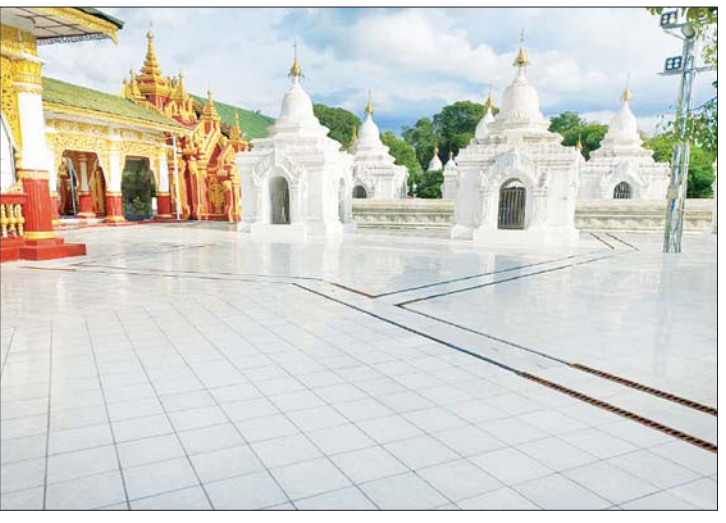
မဟာလောကမာရဇိန်စေတီ ကုသိုလ်တော်မြတ်စွာဘုရား ရင်ပြင်တော် အပိုင်း(၃) အား စကျင်ကျောက်ပြားကပ်ခြင်းလုပ်ငန်း မဆောင်ရွက်မီနှင့် ဆောင်ရွက် ပြီးစီးမှု မှတ်တမ်းဓာတ်ပုံ။