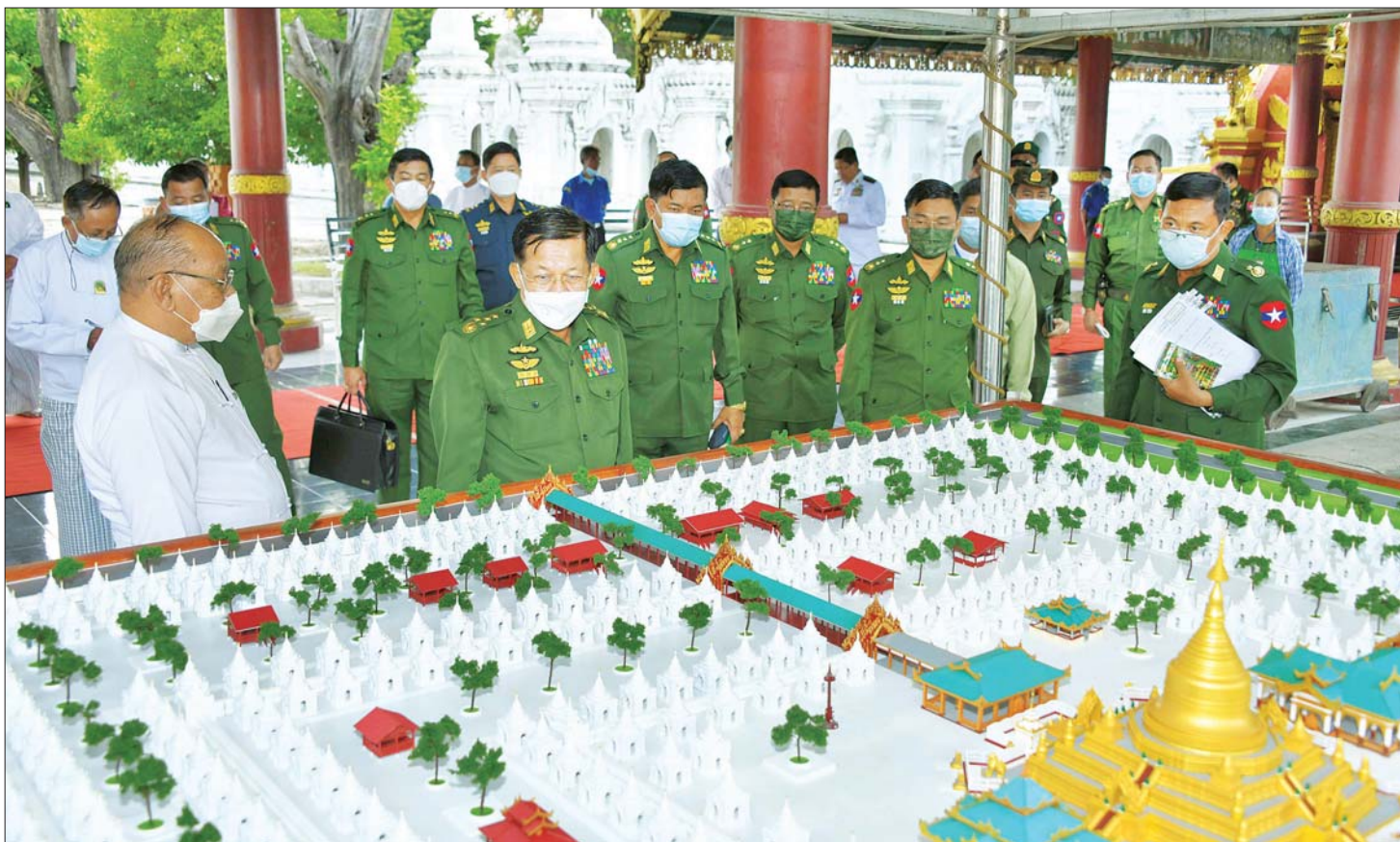
နိုင်ငံတော်စီမံအုပ်ချုပ်ရေးကောင်စီဥက္ကဋ္ဌ နိုင်ငံတော်ဝန်ကြီးချုပ် ဗိုလ်ချုပ်မှူးကြီး မင်းအောင်လှိုင် ပဉ္စမသင်္ဂါယနာတင် မဟာလောကမာရဇိန်စေတီ ကုသိုလ်တော်မြတ်စွာဘုရားရှိ ကျောက်စာရုံများ၏ ပုံစံအသစ်ပြုလုပ်ထားရှိမှု အခြေအနေကို ကြည့်ရှုစစ်ဆေးစဉ်။