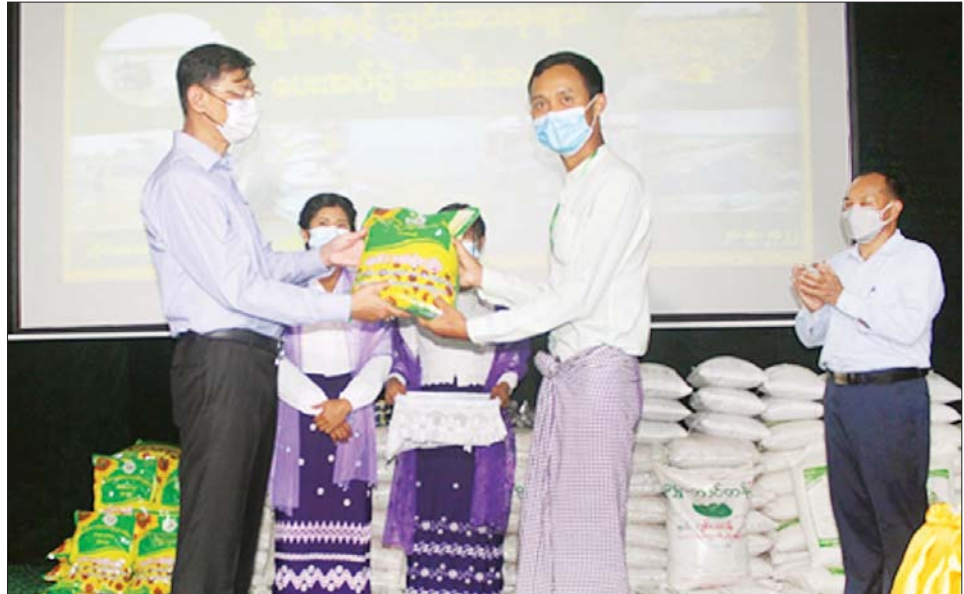
နိုင်ငံတော်စီမံအုပ်ချုပ်ရေးကောင်စီအဖွဲ့ဝင်၊ ကာကွယ်ရေးဝန်ကြီးဌာန ပြည်ထောင်စုဝန်ကြီး ဗိုလ်ချုပ်ကြီး မြထွန်းဦး တောင်သူများအား မျိုးစေ့များ ပေးအပ်စဉ်။

ဆက်လက်၍ ပြည်ထောင်စုဝန်ကြီး၊ တိုင်းဒေသ ကြီး ဝန်ကြီးချုပ်၊ တိုင်းမှူးနှင့် တာဝန်ရှိသူများသည် နေ့လယ်ပိုင်းတွင် မုံရွာမြို့ရှိ နယ်မြေခံတပ်မတော် ဆေးရုံသို့ သွားရောက်ကာ ဆေးကုသမှုခံယူနေသော တပ်မတော်သားများ၊ တပ်မတော်သားမိသားစုဝင် များ၊ မြန်မာနိုင်ငံရဲတပ်ဖွဲ့ဝင်များ၊ ဒေသခံပြည်သူများ အား သွားရောက်ကြည့်ရှုအားပေးပြီး တာဝန်ရှိသူများ က တက်ရောက်ကုသနေသော လူနာအခြေအနေ များအား လိုက်လံရှင်းလင်းပြသရာ ပြည်ထောင်စု ဝန်ကြီးက လိုအပ်သည်များ ဖြည့်ဆည်းဆောင်ရွက် ပေးသည်။ ထို့နောက် ဆေးရုံတက်ရောက်ကုသနေ သော လူနာများအား အာဟာရပြည့် စားသောက် ဖွယ်ရာများ ထောက်ပံ့ပေးအပ်ကြောင်း သတင်းရရှိ သတင်းစဉ်