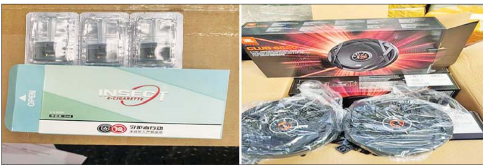
မြန်မာစက်မှုဆိပ်ကမ်း ကုန်သေတ္တာစစ်ဆေးရေးစခန်း၌ သိမ်းဆည်းရမိသည့် ကုန်ပစ္စည်းများကို တွေ့ရ စဉ်။

တရားမဝင် ကုန်သွယ်မှုတိုက်ဖျက်ရေး ဦးဆောင် ကော်မတီ၏ ကြီးကြပ်ကွပ်ကဲမှုဖြင့် တရားမဝင် ကုန်သွယ်မှုများကို ဥပဒေနှင့်အညီ ထိရောက်စွာ တားဆီးအရေးယူနိုင်ရေး ဆောင်ရွက်လျက်ရှိရာ စက်တင်ဘာ ၂၆ ရက်တွင် အကောက်ခွန်ဦးစီးဌာန၏ စီမံခန့်ခွဲမှုဖြင့် ရန်ကုန်တိုင်းဒေသကြီးရှိ ကုန်သေတ္တာ စစ်ဆေးရေးစခန်းများ၌ တာဝန်ကျအကောက်ခွန် စစ်ဆေးရေးအဖွဲ့က စစ်ဆေးမှုများ ဆောင်ရွက်ခဲ့ရာ ထီးတန်းဆိပ်ကမ်း ကုန်သေတ္တာစစ်ဆေးရေးစခန်း၌ သွင်းကုန်ကြေညာလွှာ (ID) တွင် ကြေညာထားသည် ထက် ပိုမိုတင်သွင်းလာသော လူသုံးကုန်ပစ္စည်းများ (ခန့်မှန်းတန်ဖိုးငွေကျပ် ၂၅၆၁၅၈၀)ကို လည်း ကောင်း၊ အေးရှားပေါ့လ်ကုန်သေတ္တာစစ်ဆေးရေး စခန်း၌ FDA ထောက်ခံချက် သက်တမ်းကုန်ဆုံးနေ သော အလှကုန်ပစ္စည်းများ (ခန့်မှန်းတန်ဖိုးငွေကျပ် ၅၃၈၃၆၆၅)ကို လည်းကောင်း၊ မြန်မာစက်မှုဆိပ်ကမ်း ကုန်သေတ္တာစစ်ဆေးရေးစခန်း၌ သွင်းကုန်ကြေညာ လွှာ (ID) တွင် ကြေညာထားခြင်းမရှိသည့် ဆိုင်ကယ် အပိုပစ္စည်းများ၊ လူသုံးကုန်ပစ္စည်းများနှင့် စားသုံးဆီ များ (ခန့်မှန်းတန်ဖိုးငွေကျပ် ၁၀၀၃၈၃၆၆၀) ကို လည်းကောင်း၊ မြန်မာအပြည်ပြည်ဆိုင်ရာ ဆိပ်ကမ်း (သီလဝါ) ကုန်သေတ္တာစစ်ဆေးရေးစခန်း၌ သွင်းကုန် ကြေညာလွှာ (ID) တွင် ကြေညာထားသည်ထက် ပိုမိုပါရှိလာသော ဖိနပ် ၁၀၈၀၀ စုံ (ခန့်မှန်းတန်ဖိုး ငွေကျပ် ၁၁၃၄၀၀၀၀)ကိုလည်းကောင်း၊ စုစုပေါင်း ခန့်မှန်းတန်ဖိုး ငွေကျပ် ၁၁၉၆၆၈၉၀၅ ကို သိမ်းဆည်းရမိခဲ့ပြီး အကောက်ခွန်လုပ်ထုံးလုပ်နည်း