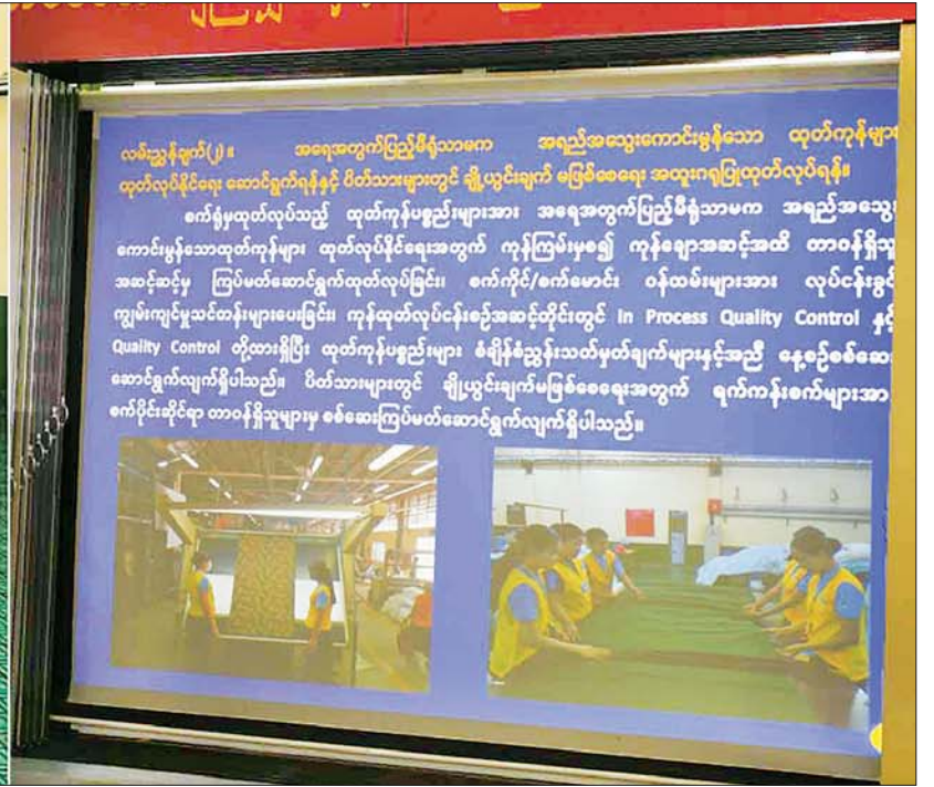
နိုင်ငံတော်စီမံအုပ်ချုပ်ရေးကောင်စီဥက္ကဋ္ဌ တပ်မတော်ကာကွယ်ရေးဦးစီးချုပ် ဗိုလ်ချုပ်မှူးကြီး မင်းအောင်လှိုင် အား တပ်မတော်ချည်မျှင်နှင့်အထည်စက်ရုံ (မိတ္ထီလာ)၌ စစ်လက်နက်ပစ္စည်း ညွှန်ကြားရေးမှူးရုံး ညွှန်ကြားရေးမှူး ဗိုလ်ချုပ် ဝင်းလွင်က ရှင်းလင်းတင်ပြစဉ်။