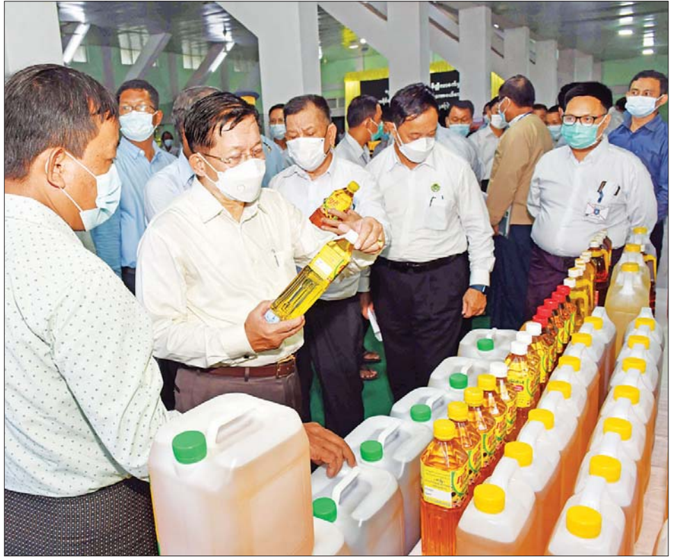
နိုင်ငံတော်စီမံအုပ်ချုပ်ရေးကောင်စီဥက္ကဋ္ဌ နိုင်ငံတော်ဝန်ကြီးချုပ် ဗိုလ်ချုပ်မှူးကြီး မင်းအောင်လှိုင် နှင့်အဖွဲ့ဝင်များ စက်မှုဇုန်မှထုတ်လုပ်သည့် ဆီထွက်ပစ္စည်းများ ခင်းကျင်းပြသထားမှုကို လှည့်လည် ကြည့်ရှုစဉ်။