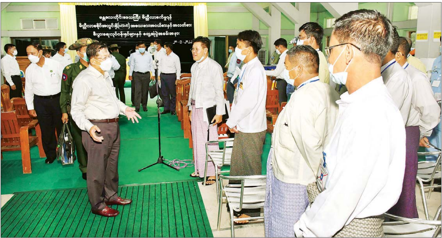
နိုင်ငံတော်စီမံအုပ်ချုပ်ရေးကောင်စီဥက္ကဋ္ဌ နိုင်ငံတော်ဝန်ကြီးချုပ် ဗိုလ်ချုပ်မှူးကြီး မင်းအောင်လှိုင် အသေးစား၊ အငယ်စားနှင့် အလတ်စား စီးပွားရေး (MSME) လုပ်ငန်းရှင်များအား ရင်းရင်းနှီးနှီး နှုတ်ဆက်စဉ်။

မန္တလေးတိုင်းဒေသကြီးအတွင်း ဝါစိုက်ဧက ပေါင်း ၃၆၀၀၀ ကျော်ရှိပြီး ချည်မျှင်ရှည်ဝါနှင့် ချည် မျှင်တိုဝါများကို စိုက်ပျိုးကြကြောင်း၊ မည်သည့် ဝါကိုစိုက်ပျိုးသည်ဖြစ်စေ ဝါအထွက်နှုန်းများ ကောင်းမွန်အောင် ဆောင်ရွက်ရန်လိုကြောင်း၊ အထွက်နှုန်း ကောင်းမွန်ရန်အတွက် မျိုးကောင်း မျိုးသန့်ဖြစ်ရန်၊ သွင်းအားစုများလုံလောက်စွာ ရရှိ ရန်နှင့် စိုက်နည်းစနစ်များ မှန်ကန်ရန်လိုကြောင်း၊ ဝါအထွက်နှုန်းများတိုးတက်လာမည်ဆိုပါက ဝါနှင့် ပတ်သက်သည့် စက်မှုလုပ်ငန်းများ တိုးတက်လာ မည်ဖြစ်သဖြင့် မိတ္ထီလာခရိုင်အတွင်း ဝါအထွက်နှုန်း တိုးတက်ရေး ဝိုင်းဝန်းကြိုးပမ်းဆောင်ရွက်ကြရန် လိုကြောင်း၊ အလားတူ အခြားဆီထွက်သီးနှံများကို စိုက်ဧကတိုးချဲ့ခြင်းထက် တစ်ဧကချင်းအထွက်နှုန်း တိုးတက်ရေး ဆောင်ရွက်ကြရန်လိုကြောင်း၊ တစ်ဧကချင်း အထွက်နှုန်းများ တိုးတက်ကောင်းမွန် လာမည်ဆိုပါက စီးပွားရေးလည်း တိုးတက်လာမည် ဖြစ်ကြောင်း၊ ကုန်ကြမ်းပစ္စည်းများ ထုတ်လုပ်နိုင်ရေး အတွက် မိတ္ထီလာခရိုင်အနေဖြင့် ကြိုးပမ်းဆောင်ရွက်