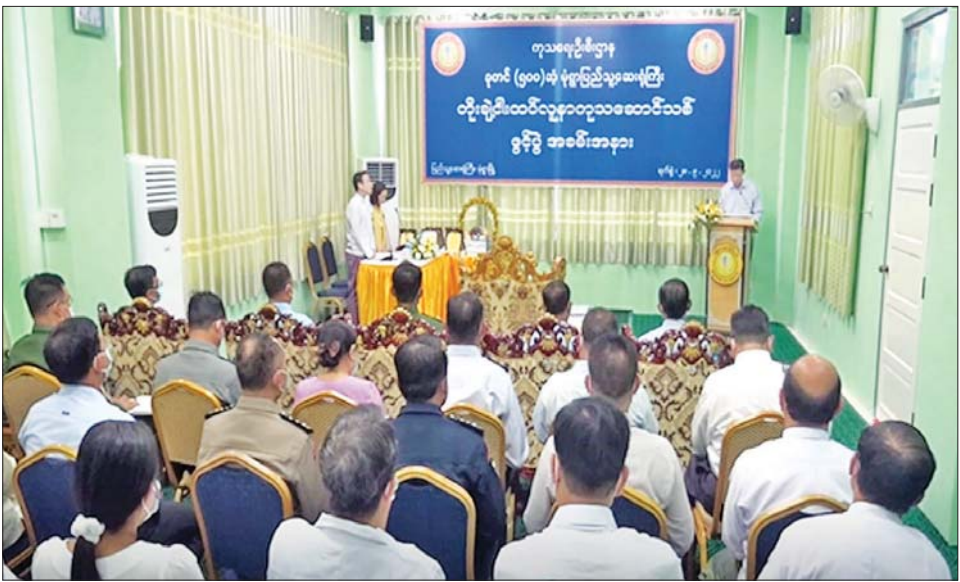
နိုင်ငံတော်စီမံအုပ်ချုပ်ရေးကောင်စီအဖွဲ့ဝင်၊ ကာကွယ်ရေးဝန်ကြီးဌာန ပြည်ထောင်စုဝန်ကြီး ဗိုလ်ချုပ်ကြီး မြထွန်းဦး၊ မုံရွာမြို့ ခုတင် (၅၀၀) ဆံ့ ပြည်သူ့ဆေးရုံကြီးရှိ တိုးချဲ့ငါးထပ်ဆောင်သစ်ဖွင့်ပွဲတွင် အမှာ စကားပြောကြားစဉ်။

နိုင်ငံတော်စီမံအုပ်ချုပ်ရေးကောင်စီအနေဖြင့် ကိုဗစ်-၁၉ ကပ်ရောဂါ ကာကွယ်ထိန်းချုပ်ကုသရေး လုပ်ငန်းများကို အရှိန်အဟုန်မပြတ် ဆောင်ရွက် နေပြီး ကိုဗစ်-၁၉ ကပ်ရောဂါကြောင့် ထိခိုက်ခဲ့သည့်