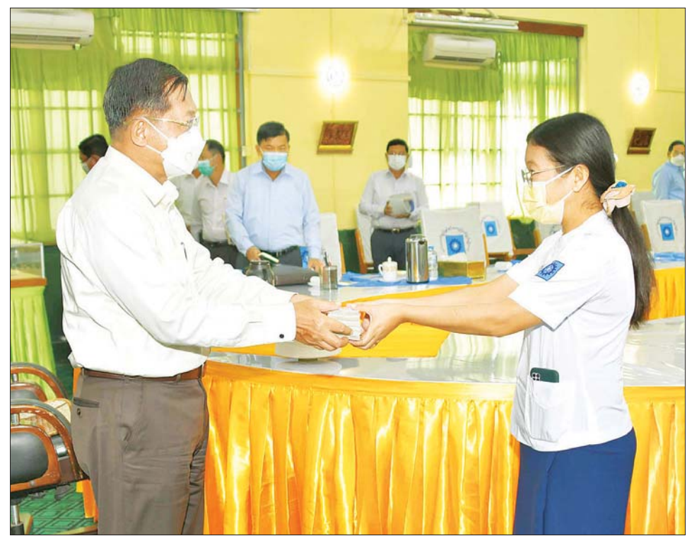
နိုင်ငံတော်စီမံအုပ်ချုပ်ရေးကောင်စီဥက္ကဋ္ဌ တပ်မတော်ကာကွယ်ရေးဦးစီးချုပ် ဗိုလ်ချုပ်မှူးကြီး မင်းအောင်လှိုင် စက်ရုံဝန်ထမ်းများအတွက် ချီးမြှင့်ငွေများ ပေးအပ်စဉ်။

ကာကွယ်ရေး ဦးစီးချုပ်အား စက်ရုံ အစည်းအဝေးခန်းမ၌ စစ်လက်နက်ပစ္စည်း ညွှန်ကြား ရေးမှူးရုံး ညွှန်ကြားရေးမှူး ဗိုလ်ချုပ် ဝင်းလွင်က ၂၀၂၁ ခုနှစ် ဒီဇင်ဘာလအတွင်း နိုင်ငံတော် စီမံအုပ်ချုပ်ရေးကောင်စီ ဥက္ကဋ္ဌ တပ်မတော်ကာကွယ်ရေး ဦးစီးချုပ် လာရောက်စစ်ဆေးစဉ် လမ်းညွှန် ချက်များအား အကောင်အထည် ဖော် ဆောင်ရွက်လျက်ရှိမှု၊ စက်ရုံသမိုင်းအကျဉ်း၊ စက်ရုံမှ ချည်အမျိုးမျိုး ထုတ်လုပ်နိုင်မှု အခြေအနေများ၊ ဝန်ထမ်းများ သက်သာ ချောင်ချိရေးအတွက် စိုက်ပျိုးမွေးမြူရေး လုပ်ငန်းများ ဖြင့် ဆောင်ရွက်ပေးနေမှု၊ ၂/၈၀ ချည်များအား ပြည်တွင်း၌ ထွက်ရှိ သည့် ဝါများဖြင့် ထုတ်လုပ်နိုင် ရေး စမ်းသပ်ဆောင်ရွက်လျက်ရှိမှု နှင့် စက်စမ်းသပ်လည်ပတ်နိုင်ရေး ဆောင်ရွက်လျက်ရှိမှု အခြေအနေ များကို ရှင်းလင်းတင်ပြသည်။