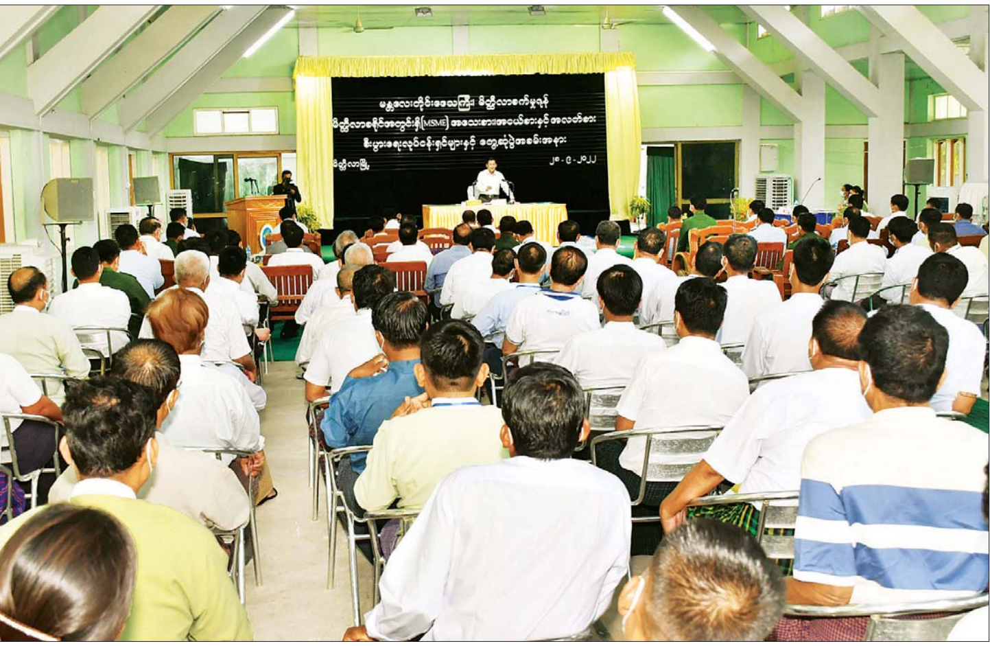
နိုင်ငံတော်စီမံအုပ်ချုပ်ရေးကောင်စီဥက္ကဋ္ဌ နိုင်ငံတော်ဝန်ကြီးချုပ် ဗိုလ်ချုပ်မှူးကြီး မင်းအောင်လှိုင် မိတ္ထီလာခရိုင်အတွင်းရှိ အသေးစား၊ အငယ်စားနှင့် အလတ်စား စီးပွားရေး (MSME) လုပ်ငန်းရှင်များအား တွေ့ဆုံအမှာစကားပြောကြားစဉ်။

တင်ပြချက်များနှင့် စပ်လျဉ်း၍ ပြည်ထောင်စုဝန်ကြီးများဖြစ်ကြသည့် ဦးတင်ထွဋ်ဦး၊ ဦးလှမိုး၊ ဒေါက်တာချာလီသန်း၊ မန္တလေးတိုင်းဒေသကြီးဝန်ကြီးချုပ်ဦးမောင်ကို တို့က မြန်မာနိုင်ငံနှင့်ကိုက်ညီသည့် အဆင့်မီဝါမျိုးများ ရရှိရေးဆောင်ရွက်လျက်ရှိမှု၊ အရည်အသွေးပြည့်မီသည့် ဝါမျိုးစေ့များ ပိုမိုထုတ်လုပ်နိုင်ရေးအတွက် ဝါစိုက်ပျိုးတောင်သူများ၊ ပုဂ္ဂလိကလုပ်ငန်းရှင်များနှင့် ဆောင်ရွက်လျက်ရှိမှု၊ ဓာတ်မြေဩဇာများ ဈေးနှုန်းသက်သာစွာဖြင့် ရောင်းချနိုင်ရေး ဆောင်ရွက်လျက်ရှိမှု၊ နိုင်ငံတော်မှ ဆီထုတ်လုပ်မှုတိုးတက်ရေးအတွက် ကြိုးပမ်းဆောင်ရွက်လျက်ရှိမှု၊ ဆီလုပ်ငန်းရှင်များအတွက် ချေးငွေများထုတ်ပေးရန် ဆောင်ရွက်လျက်ရှိမှု၊ ကျေးလက်နေထိုင်သူများ စိုက်ပျိုးရေးလုပ်ငန်းများ ဆောင်ရွက်ရန်အတွက် လိုအပ်သည့် သွင်းအားစု