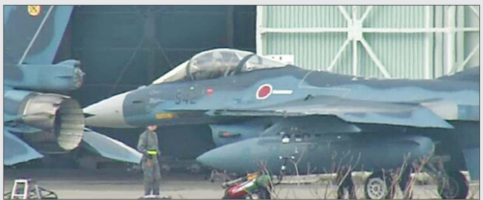
ဂျပန်ကိုယ်ပိုင်လေကြောင်းရန် ကာကွယ်ရေးတပ်ဖွဲ့မှ တိုက်လေယာဉ်များကို တွေ့ရစဉ်။

ဗျူဟာကျွမ်းကျင်မှုများ တိုးတက်စေရန် ဖွဲ့စည်း လေ့ကျင့်မှုပါဝင်ကြောင်း အေအက်စ်ဒီအက်ဖ်က ပြောသည်။ ဂျပန်သည် အင်ဒို-ပစိဖိတ်ဒေသ၌ ပါဝင်ပတ်သက်မှုကို မြှင့်တင်သွားမည်ဟု ၂၀၂၀ ပြည့်နှစ်က သံတမန်ရေးရာနှင့် အမျိုးသားလုံခြုံရေး လမ်းညွှန်ချက်တွင် ပြောကြားထားသည်။