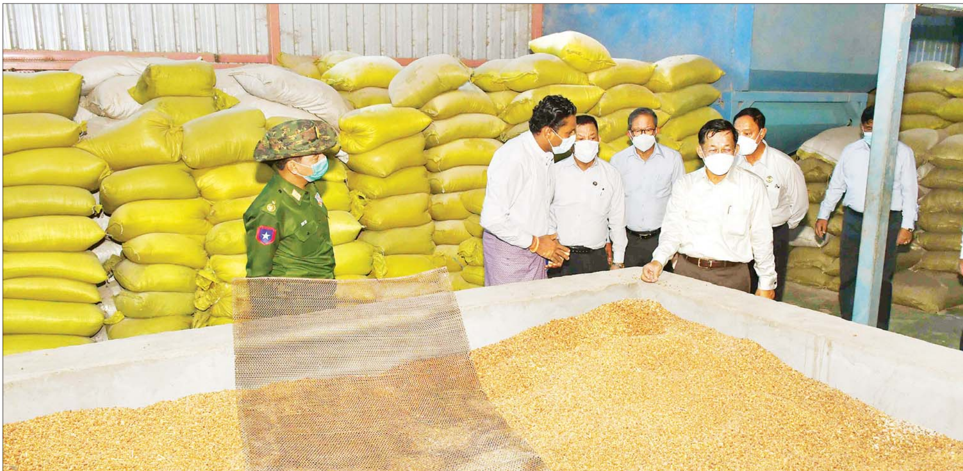
နိုင်ငံတော်စီမံအုပ်ချုပ်ရေးကောင်စီဥက္ကဋ္ဌ နိုင်ငံတော်ဝန်ကြီးချုပ် ဗိုလ်ချုပ်မှူးကြီး မင်းအောင်လှိုင်နှင့်အဖွဲ့ဝင်များ မိတ္ထီလာစက်မှုဇုန်ရှိ သိန်းကမ္ဘာကျော် ကုလားပဲခွဲစက်အတွင်း လှည့်လည်ကြည့်ရှုစဉ်။