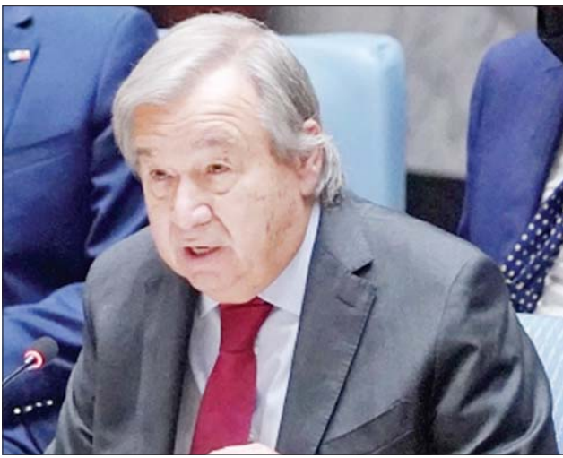
ကုလသမဂ္ဂအတွင်းရေးမှူးချုပ် အန်တိုနီယို ဂုတာရက်စ်။

ဂျီနီဗာ စက်တင်ဘာ ၂၇ ကုလသမဂ္ဂ အတွင်းရေးမှူးချုပ် အန်တိုနီယို ဂုတာရက်စ်က နျူကလီးယား ခြိမ်းခြောက်မှု ခေတ်ကို အဆုံးသတ်ရန် တောင်းဆိုလိုက်သည်။ နျူကလီးယား လက်နက် မဖျက်သိမ်းဘဲနှင့် ငြိမ်းချမ်းရေးမရနိုင်ဟု ဂုတာရက်စ်က ပြောကြားလိုက်သည်။ ကုလသမဂ္ဂသည် စက်တင်ဘာလ ၂၆ ရက်နေ့ကို အပြည်ပြည်ဆိုင်ရာ နျူကလီးယားလက်နက်များ လုံးဝပျောက်ရေးနေ့အဖြစ် သတ်မှတ်ခဲ့သည်။ ဂုတာရက်စ်သည် အပြည်ပြည်ဆိုင်ရာ နျူကလီးယားလက်နက်များ လုံးဝပျောက်ရေးနေ့ အထိမ်းအမှတ်အဖြစ် နယူးယောက်ရှိ ကုလသမဂ္ဂဌာနချုပ်တွင် စက်တင်ဘာ ၂၆ ရက်က