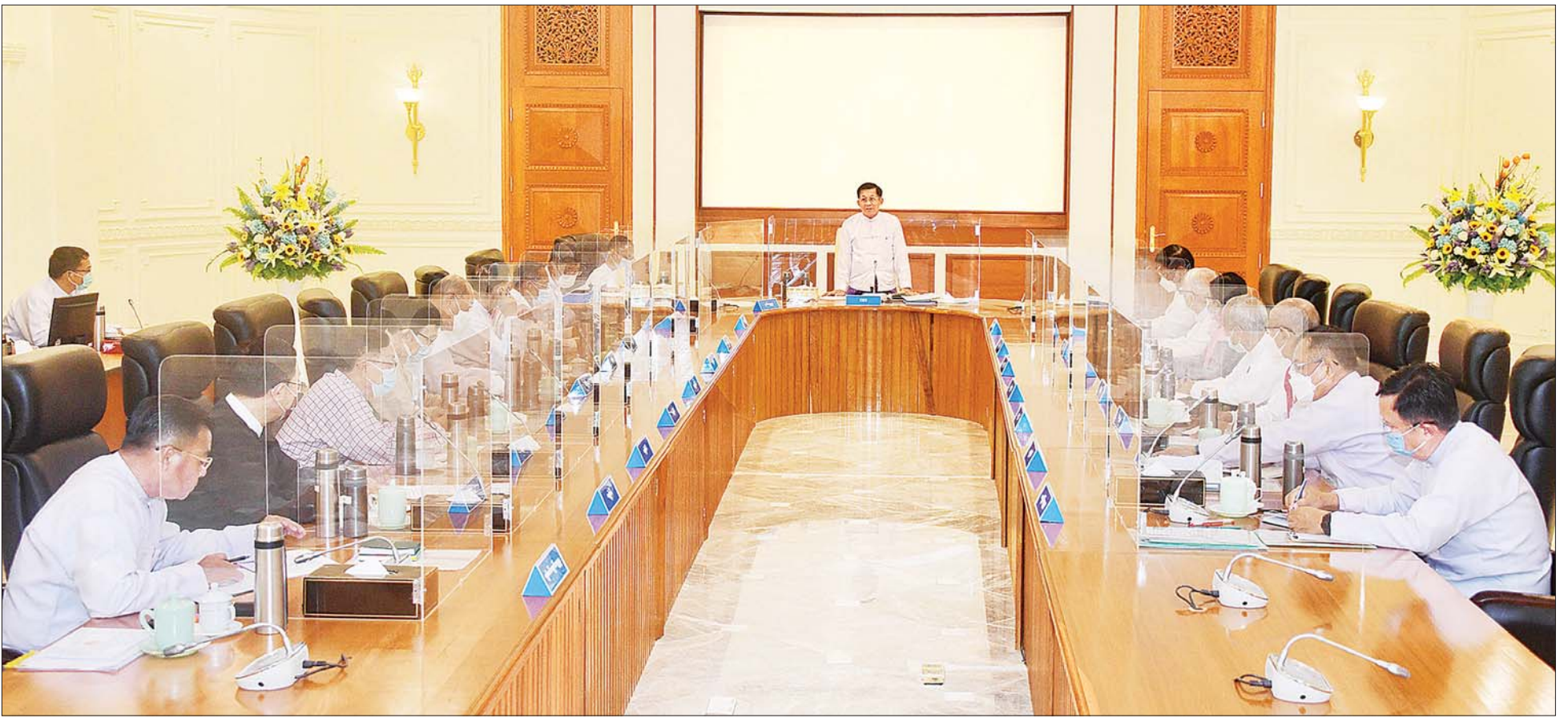
နိုင်ငံတော်စီမံအုပ်ချုပ်ရေးကောင်စီဥက္ကဋ္ဌ နိုင်ငံတော်ဝန်ကြီးချုပ် ဗိုလ်ချုပ်မှူးကြီး မင်းအောင်လှိုင် နိုင်ငံတော်စီမံအုပ်ချုပ်ရေးကောင်စီ အစည်းအဝေး (၈/၂၀၂၂)တွင် အမှာစကားပြောကြားစဉ်။