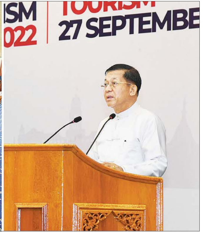
နိုင်ငံတော်စီမံအုပ်ချုပ်ရေးကောင်စီဥက္ကဋ္ဌ နိုင်ငံတော်ဝန်ကြီးချုပ် ဗိုလ်ချုပ်မှူးကြီး မင်းအောင်လှိုင် ၂၀၂၂ ခုနှစ်၊ ကမ္ဘာ့ခရီးသွားလုပ်ငန်းနေ့ အထိမ်းအမှတ်အခမ်းအနားတွင် အမှာစကားပြောကြားစဉ်။