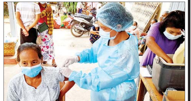
ကျောက်ပန်းတောင်းမြို့နယ်၌ ပြည်သူများနှင့် ကျောင်းသားကျောင်းသူများအား ကာကွယ်ဆေးများ နေ့စဉ်ထိုးနှံပေးလျက်ရှိ

ကျောက်ပန်းတောင်း စက်တင်ဘာ ၂၇ မန္တလေးတိုင်းဒေသကြီး ကျောက်ပန်းတောင်းမြို့နယ်၌ ကိုဗစ်- ၁၉ ရောဂါကူးစက်ဖြစ်ပွားမှု လျော့နည်းကျဆင်းစေရေးအတွက် မြို့နယ်ကိုဗစ်-၁၉ ရောဂါထိန်းချုပ်ရေးနှင့် အရေးပေါ်တုံ့ပြန်ရေးကော်မတီ၏ ကြီးကြပ်မှုဖြင့် ပုံမှန်ကာကွယ်ဆေးထိုးခြင်းနှင့် ထပ်ဆောင်းကာကွယ်ဆေးထိုးနှံခြင်းလုပ်ငန်းများကို နေ့စဉ်ဆောင်ရွက်ပေးလျက်ရှိရာ စက်တင်ဘာ ၂၆ ရက်က ဆေးထိုးစုရပ်ဖြစ်သည့် မြို့နယ်အားကစားခန်းမ၌ ကာကွယ်ဆေးလာရောက်ထိုးနှံသူများပြားခဲ့သည်။