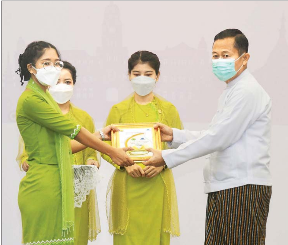
နိုင်ငံတော်စီမံအုပ်ချုပ်ရေးကောင်စီ ဒုတိယဥက္ကဋ္ဌ ဒုတိယဝန်ကြီးချုပ် ဒုတိယဗိုလ်ချုပ်မှူးကြီး စိုးဝင်း ကမ္ဘာ့ခရီးသွားလုပ်ငန်းနေ့အထိမ်းအမှတ် ဆောင်းပါးပြိုင်ပွဲတွင် ဆုရရှိသူတစ်ဦးအား ဆုပေးအပ် ချီးမြှင့်စဉ်။