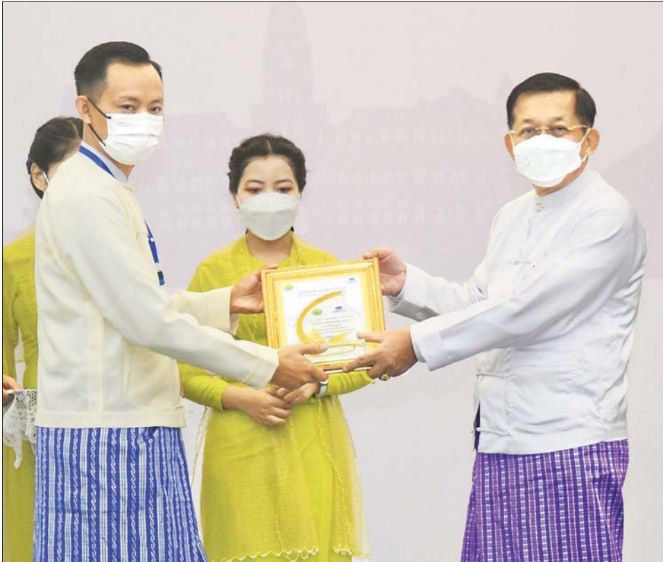
နိုင်ငံတော်စီမံအုပ်ချုပ်ရေးကောင်စီဥက္ကဋ္ဌ နိုင်ငံတော်ဝန်ကြီးချုပ် ဗိုလ်ချုပ်မှူးကြီး မင်းအောင်လှိုင် ကမ္ဘာ့ခရီးသွားလုပ်ငန်းနေ့အထိမ်းအမှတ် ခရီးသွားလုပ်ငန်းဖွံ့ဖြိုးရေး စွန့်ဦးတီထွင်မှုပြိုင်ပွဲတွင် ဆုရရှိသူ တစ်ဦးအား ဆုပေးအပ်ချီးမြှင့်စဉ်။