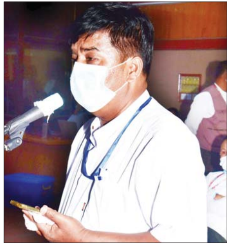
ဦးငွေထွန်း Myanmar National Post

ဗိုလ်ချုပ် ဇော်မင်းထွန်း က ပြန်လည်ဖြေကြား ရာတွင် မိမိအနေဖြင့် အသေးစိတ်ကို သက်ဆိုင်ရာသို့ မေးမြန်းပြီးမှသာ ပြန်လည်ဖြေကြားလိုကြောင်း