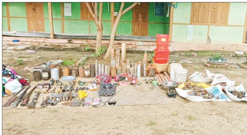
မုံရွာမြို့နယ် စည်သာကျေးရွာစာသင်ကျောင်းအတွင်းမှ လက်နက်၊ ခဲယမ်းနှင့် ဆက်စပ်ပစ္စည်းများ သိမ်းဆည်းရမိမှု။