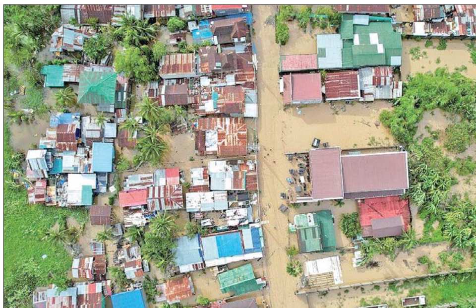
မုန်တိုင်းကြောင့် ဖိလစ်ပိုင်ဒေသအချို့တွင် ရေကြီးရေလျှံမှု ဖြစ်ပွားနေသည်ကို တွေ့ရစဉ်။

ကောင်စီက မနီလာ မြောက်ပိုင်းပြည်နယ် တစ်ခုဖြစ်သော ဘူလာကန်သို့ တနင်္ဂနွေ မွန်းလွဲပိုင်းက အင်အားပြင်းတိုင်ဖွန်းမုန်တိုင်း ကျရောက်ခဲ့သဖြင့် လျှပ်တစ်ပြက် ရေကြီးမှုဖြစ်ပွားခဲ့ရာ ကယ်ဆယ်ရေးသမား ငါးဦး သေဆုံးခဲ့ကြောင်း အတည်ပြုပြောကြားသည်။ ထို့အပြင် မုန်တိုင်းဆက်စပ် သဘာဝဘေး အန္တရာယ်များကြောင့် နောက်ထပ်သုံးဦး သေဆုံးခဲ့သေးကြောင်းနှင့် မနီလာအရှေ့တောင်ပိုင်း ဘိုင်ကောဒေသတွင် သုံးဦး ထပ်မံပျောက်ဆုံးလျက် ရှိကြောင်း အဆိုပါအေဂျင်စီက ထုတ်ပြန်ဖော်ပြခဲ့သည်။ နိုရှုသည် ယခုနှစ်အတွင်း ဖိလစ်ပိုင်နိုင်ငံကို ဝင်ရောက်တိုက်ခတ်ခဲ့သည့် (၁၁) ကြိမ်မြောက် အင်အားအပြင်းဆုံး မုန်တိုင်းဖြစ်သည်။ ဆင်ဟွာ