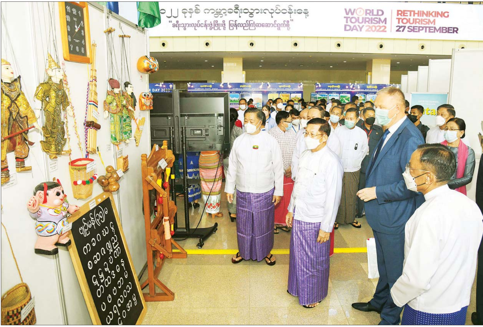
နိုင်ငံတော်စီမံအုပ်ချုပ်ရေးကောင်စီဥက္ကဋ္ဌ နိုင်ငံတော်ဝန်ကြီးချုပ် ဗိုလ်ချုပ်မှူးကြီး မင်းအောင်လှိုင်နှင့် အခမ်းအနားတက်ရောက်လာသူများ ၂၀၂၂ ခုနှစ်၊ ကမ္ဘာ့ခရီးသွားလုပ်ငန်းနေ့ အထိမ်းအမှတ်အဖြစ် ခင်းကျင်းပြသထားသည့် ခရီးစဉ်ဒေသအလိုက် ပြခန်းများအား လှည့်လည်ကြည့်ရှုစဉ်။

နေပြည်တော် စက်တင်ဘာ ၂၇ ၂၀၂၂ ခုနှစ်၊ ကမ္ဘာ့ခရီးသွားလုပ်ငန်းနေ့ အထိမ်းအမှတ်အခမ်းအနားကို ယနေ့ နံနက်ပိုင်းတွင် နေပြည်တော်ရှိ မြန်မာအပြည်ပြည်ဆိုင်ရာ ကွန်ဗင်းရှင်း (ဗဟိုဌာန-၂) ၌ ကျင်းပပြုလုပ်ရာ နိုင်ငံတော်စီမံအုပ်ချုပ်ရေးကောင်စီဥက္ကဋ္ဌ နိုင်ငံတော်ဝန်ကြီးချုပ် ဗိုလ်ချုပ်မှူးကြီး မင်းအောင်လှိုင် တက်ရောက်အမှာစကား ပြောကြားသည်။ တက်ရောက် အခမ်းအနားသို့ အမျိုးသားခရီးသွားလုပ်ငန်း ဖွံ့ဖြိုးတိုးတက်ရေး ဗဟိုကော်မတီဥက္ကဋ္ဌ၊ နိုင်ငံတော် စီမံအုပ်ချုပ်ရေးကောင်စီ ဒုတိယဥက္ကဋ္ဌ ဒုတိယဝန်ကြီးချုပ် ဒုတိယဗိုလ်ချုပ်မှူးကြီး စိုးဝင်း၊ နိုင်ငံတော် စီမံအုပ်ချုပ်ရေးကောင်စီအဖွဲ့ဝင်များ၊ ကောင်စီတွဲဖက်အတွင်းရေးမှူး၊ ပြည်ထောင်စုဝန်ကြီးများ၊ နေပြည်တော်ကောင်စီဥက္ကဋ္ဌ၊ နေပြည်တော် တိုင်းစစ်ဌာနချုပ် တိုင်းမှူး၊ မြန်မာနိုင်ငံဆိုင်ရာ နိုင်ငံခြားသံရုံးများမှ သံအမတ်ကြီးများ၊ ညွှန်ကြားရေးမှူးချုပ်များ၊ စာမျက်နှာ ၃ ကော်လံ ၁ □