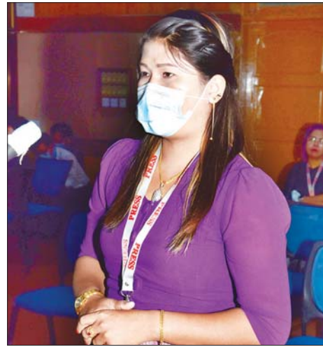
ဒေါ်မျိုးပပပြုံးဝေလွင် Queen For Peace News Agency

ဗိုလ်ချုပ် ဇော်မင်းထွန်း က နယ်ဒါးမြစ်နှင့် ပတ်သက်ပြီး မိမိအနေဖြင့်ပြောလိုသည်မှာ ၎င်းတို့ အနေဖြင့် နယ်စပ်ဒေသဖွံ့ဖြိုးရေးအတွက် လမ်းပန်း ဆက်သွယ်ရေးလုပ်ကိုင်နေသူများအား သတ်ဖြတ် ခဲ့ကြောင်း၊ နောက်ပိုင်းတွင် KNU၊ KNDO အဖွဲ့မှ ခွဲထွက်၍ ကော်သူးလေ ARMY ကို ဖွဲ့စည်းခဲ့ကြောင်း၊ ယင်းကိစ္စနှင့်ပတ်သက်၍ KNU၊ KNDO အဖွဲ့များ မှ ကန့်ကွက်ခဲ့ကြောင်း၊ နယ်ဒါးမြစ်အနေဖြင့် လက်နက်ကိုင်အဖွဲ့များ ထပ်မံဖွဲ့စည်းနေကြောင်း၊ အခြားလက်နက်ကိုင်အဖွဲ့များနှင့် ပူးပေါင်း၍ နယ်စပ်ဒေသများတွင် တိုက်ခိုက်မှုများရှိကြောင်း၊