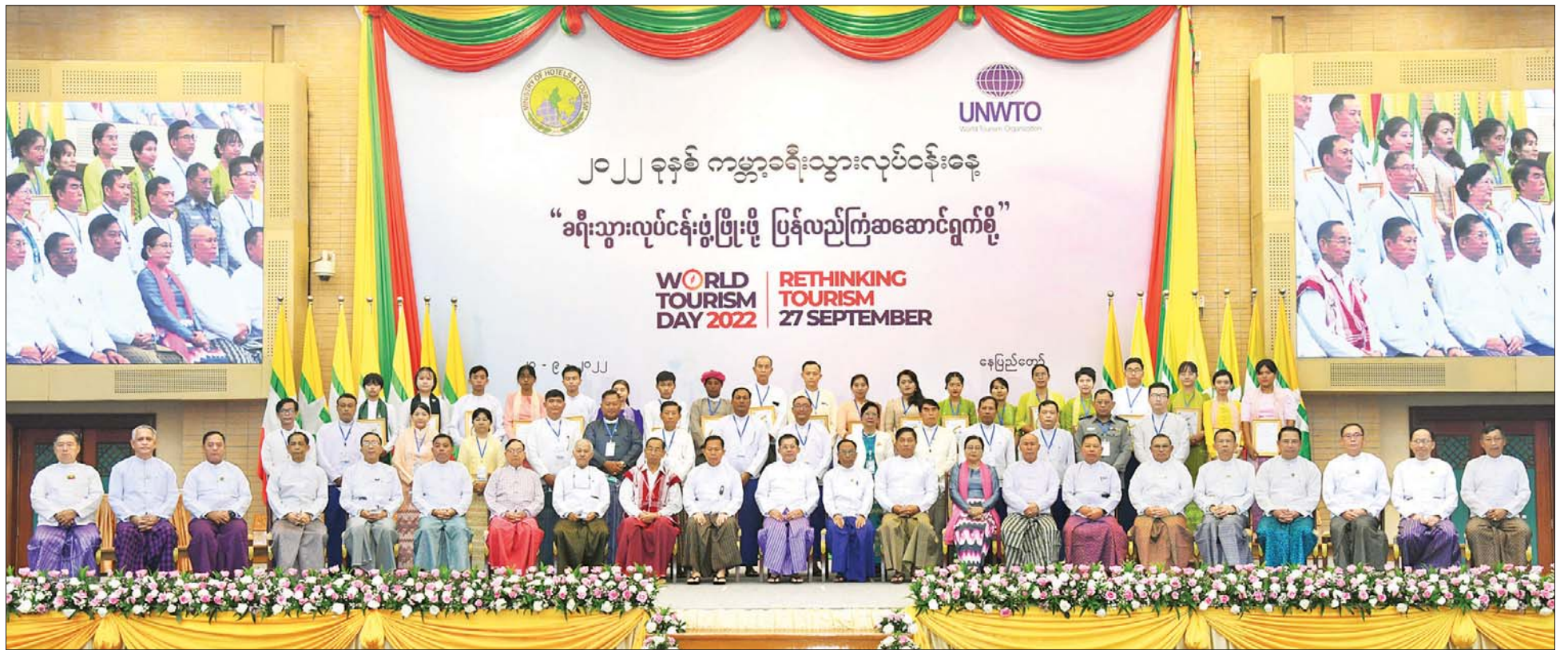
နိုင်ငံတော်စီမံအုပ်ချုပ်ရေးကောင်စီဥက္ကဋ္ဌ နိုင်ငံတော်ဝန်ကြီးချုပ် ဗိုလ်ချုပ်မှူးကြီး မင်းအောင်လှိုင်နှင့် အဖွဲ့ဝင်များ ဆုရရှိသူများနှင့်အတူ အမှတ်တရ မှတ်တမ်းတင်ဓာတ်ပုံရိုက်စဉ်။