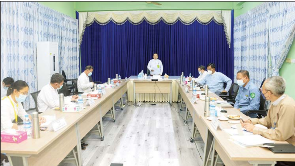
အရွယ်ကလေးတိုင်း ပညာသင်ယူ မှု အခွင့်အလမ်းများရရှိစေရန် အတွက် မည်သည့်ခွဲခြားမှုမျိုးမှ မရှိစေဘဲ ကျောင်းသို့ရောက်ရှိ စေရန် ပုံစံအမျိုးမျိုးဖြင့် ကြိုးပမ်း ဆောင်ရွက်လျက်ရှိကြောင်း၊ နိုင်ငံ သားတိုင်း KG+9 အခြေခံပညာ သင်ယူပြီးမြောက်ရေးကိုအကောင် အထည်ဖော် ဆောင်ရွက်နေ ကြောင်း၊ KG+9 အောင်မြင်ပြီးသူ များအနေဖြင့် စိုက်ပျိုးရေးအထက် တန်းကျောင်း၊ မွေးမြူရေးအထက် တန်းကျောင်းနှင့် နည်းပညာ အထက်တန်း ကျောင်းများသို့ တက်ရောက်လိုပါက တက်ရောက် နိုင်ကြောင်း၊ KG+9 ပြီးမြောက် သည့်နှင့်သက်မွေးပညာသင်ကြား လိုသူများ ဆက်လက်သင်ယူ နိုင်ရေးအတွက် သိပ္ပံနှင့် နည်းပညာဝန်ကြီးဌာန၊ စိုက်ပျိုး ရေး၊ မွေးမြူရေးနှင့် ဆည်မြောင်း ဝန်ကြီးဌာနတို့နှင့် ပူးပေါင်းချိတ် ဆက် ဆောင်ရွက်ထားကြောင်း ပြောကြားသည်။ အဆိုပါ အစည်းအဝေးကို ယနေ့နံနက်ပိုင်းက နေပြည်တော် ရှိ ပညာရေးဝန်ကြီးဌာန အစည်း အဝေးခန်းမ၌ ကျင်းပခြင်း ဖြစ်ပြီး လုပ်ငန်းကော်မတီဥက္ကဋ္ဌ၊ ကော်မတီအဖွဲ့ဝင်များနှင့် တာဝန်

နေပြည်တော် စက်တင်ဘာ ၂၇ လာမည့်ပညာသင်နှစ်မှ စတင်ပြီး ခရိုင် ၅၀ ရှိ အခြေခံပညာအထက် တန်းကျောင်း ၅၀ တွင် စိုက်ပျိုး ရေး၊ မွေးမြူရေးနှင့် စက်မှု ပေါင်းစည်း အထက်တန်းကျောင်း များ တွဲဖက်ဖွင့်လှစ်သွားမည်ဖြစ် ကြောင်း ပညာရေးဝန်ကြီးဌာန ဒုတိယဝန်ကြီး ဦးဇော်ဝင်းက ယနေ့ကျင်းပသည့် ပြည်တွင်း နေ့စဉ်စွန့်ခွာသူများ ပြန်လည် နေရာချထားရေးနှင့် ယာယီခိုလှုံ ရာစခန်းများ ပိတ်သိမ်းရေး ဆိုင်ရာ အမျိုးသားအဆင့် ကော်မတီ၏ ပညာရေးနှင့် ကျန်းမာရေးလုပ်ငန်း ကော်မတီ (ပထမအကြိမ်) အစည်းအဝေး တွင် ထည့်သွင်းပြောကြား သည်။ ဆက်လက်၍ ပညာရေးနှင့် ကျန်းမာရေးလုပ်ငန်းကော်မတီ ဥက္ကဋ္ဌ၊ ပညာရေးဝန်ကြီးဌာန ဒုတိယဝန်ကြီးက ပညာရေး ဝန်ကြီးဌာနအနေဖြင့် ကျောင်းနေ