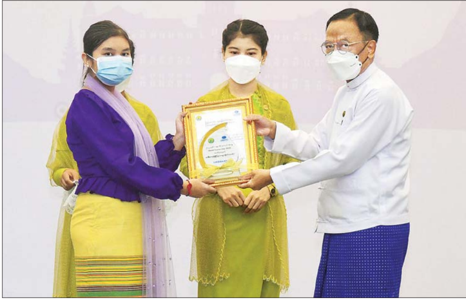
ပြည်ထောင်စုဝန်ကြီး ဒေါက်တာဌေးအောင် ကမ္ဘာ့ခရီးသွားလုပ်ငန်းနေ့အထိမ်းအမှတ် တက္ကသိုလ်အဆင့် စာစီစာကုံးပြိုင်ပွဲတွင် ဆုရရှိသူတစ်ဦးအား ဆုပေးအပ်ချီးမြှင့်စဉ်။

မြန်မာနိုင်ငံကို လာရောက်လည်ပတ်ကြသည့် ခရီးသွားဧည့်သည်များ စိတ်အေးချမ်းသာစွာဖြင့် သွားလာလည်ပတ်နိုင်ရန်၊ ခရီးသွားများအတွက် လိုအပ်သည့် သတင်းအချက်အလက်များကို ဒစ်ဂျစ်တယ်နည်းပညာဖြင့် ပြည့်ပြည့်စုံစုံနှင့် လွယ်ကူလျင်မြန်စွာ ရရှိနိုင်အောင် စီစဉ်ပေးရန်၊ ခရီးသွားဧည့်သည်များ၏ ပြည်ဝင်၊ ပြည်ထွက်ခွင့် လုပ်ထုံးလုပ်နည်းများနှင့် ကျန်းမာရေးဆိုင်ရာ သတ်မှတ်ချက်များကိုလည်း လွယ်ကူရှင်းလင်းစေရန်အတွက် ဆက်စပ်ဝန်ကြီးဌာနများအားလုံးက ပိုင်းဝန်းပံ့ပိုးကူညီ ဆောင်ရွက်သွားကြရမည်