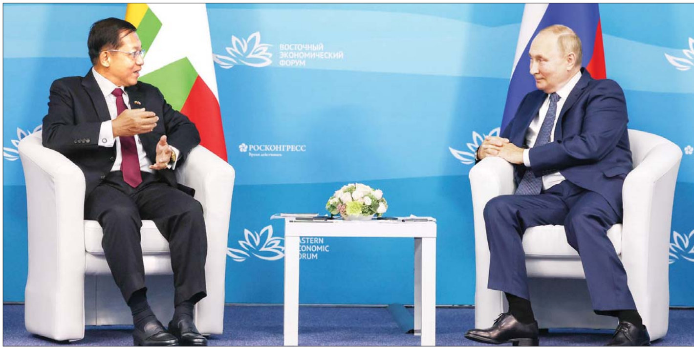
နိုင်ငံတော်စီမံအုပ်ချုပ်ရေးကောင်စီဥက္ကဋ္ဌ နိုင်ငံတော်ဝန်ကြီးချုပ် ဗိုလ်ချုပ်မှူးကြီးမင်းအောင်လှိုင်၏ ရုရှားနိုင်ငံခရီးစဉ်အတွင်း ရုရှားဖက်ဒရေးရှင်းနိုင်ငံသမ္မတ H.E. Vladimir Vladimirovich Putin နှင့် စက်တင်ဘာ ၇ ရက်က တွေ့ဆုံဆွေးနွေးစဉ်။

အမေရိကန်နှင့် အနောက်အုပ်စုသည် မြန်မာ နိုင်ငံရေးအပေါ်အစဉ် ပြည်တွင်းရေးများတွင်