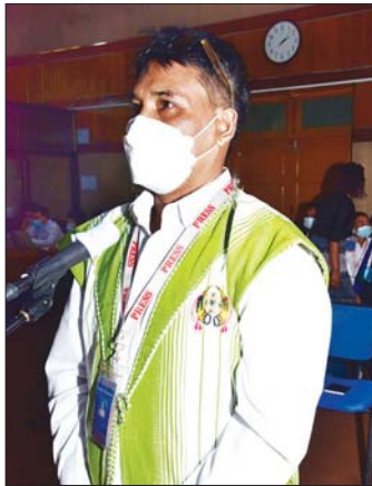
ဦးဇော်မင်းဦး တုံ့ပြောမီဒီယာ