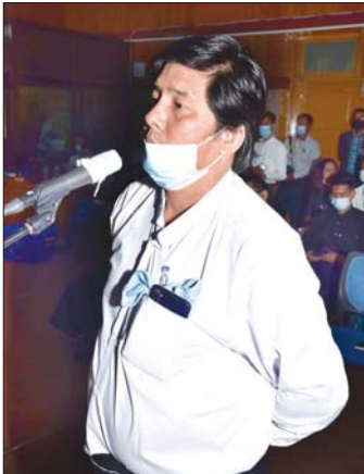
ဦးဝင်းနိုင် ခေတ်ပိုရီပျာနယ်

သိလိုကြောင်းနှင့် တိုင်းဒေသကြီးနှင့် ပြည်နယ် များတွင် တိုင်းရင်းသားရေးရာဝန်ကြီး/ လူမျိုးစု ကိုယ်စားလှယ်များရှိကြောင်း၊ ဥပမာ ကရင် ပြည်နယ် ဗမာတိုင်းရင်းသားလူမျိုးစု ကိုယ်စားလှယ် ဗမာတိုင်းရင်းသားဝန်ကြီး ဦးတေထွဋ်လှိုင်ထွေး သည် ၂၀၁၈ ခုနှစ်တွင် အကြောင်းအမျိုးမျိုးကြောင့် အနားယူနုတ်ထွက်ခဲ့ကြောင်း၊ သမ္မတနှင့် ဒုတိယ သမ္မတများအား ရက်ပေါင်း ၃၀ အတွင်း ပြန်လည် ရွေးချယ်ရမည်ဟု အခြေခံဥပဒေတွင် ဆိုထား ကြောင်း၊ တိုင်းရင်းသားရေးရာဝန်ကြီးများအား ပြန်လည်ရွေးချယ်ရန် ကာလအကန့်အသတ်မရှိခြင်း ကြောင့် အဆိုပါ ကရင်ပြည်နယ် ဗမာတိုင်းရင်းသား လူမျိုးစုကိုယ်စားလှယ်မှာ နှစ်နှစ်ကျော်ကြာအထိ မရှိခဲ့ကြောင်း၊ ထို့ကြောင့် ကရင်ပြည်နယ် ဗမာ တိုင်းရင်းသားများအနေဖြင့် များစွာနှစ်နာခဲ့ရ ကြောင်း၊ ကရင်ပြည်နယ် ဗမာတိုင်းရင်းသားရေးရာ