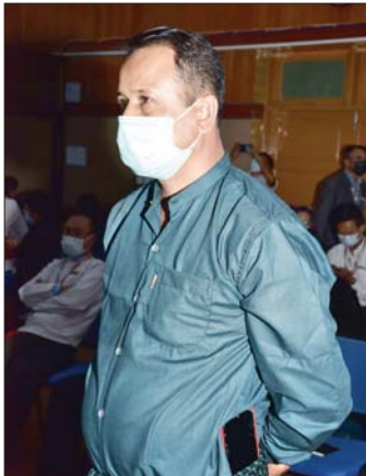
ဦးဇော်မင်းနိုင် Myanmar Public Press