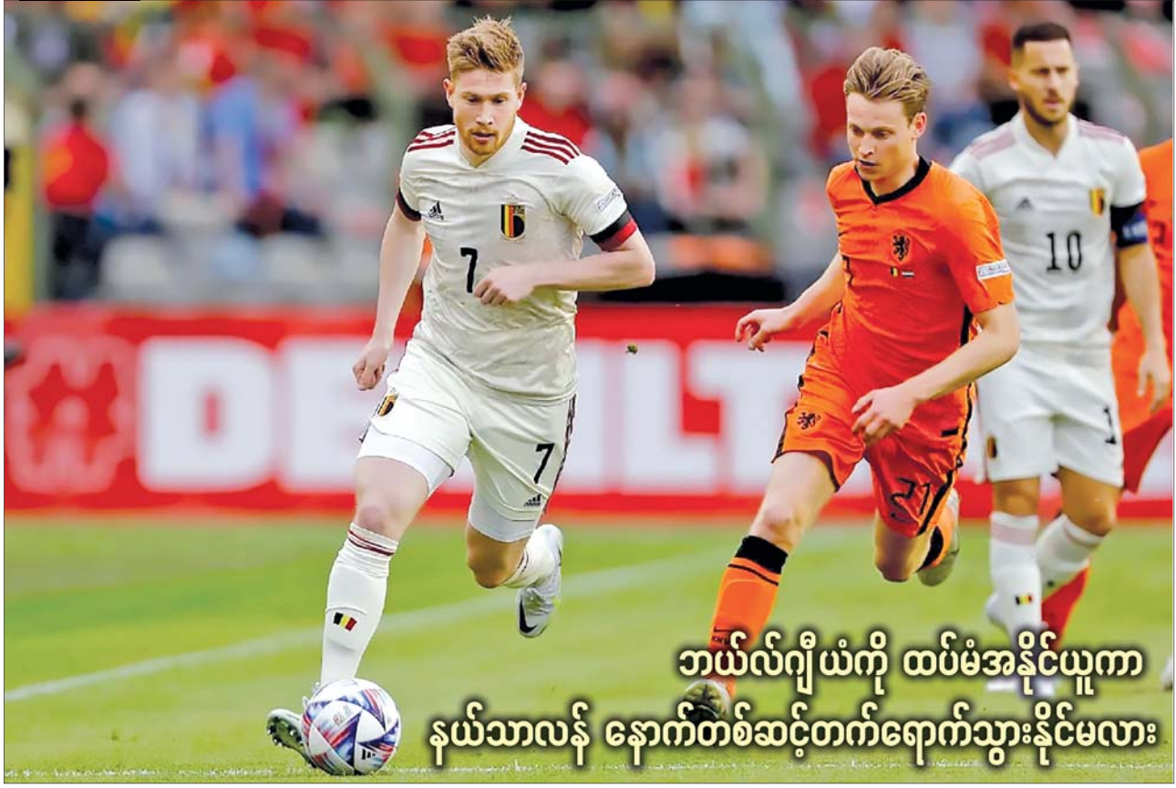
ဘယ်လ်ဂျီယံကို ထပ်မံအနိုင်ယူကာ နယ်သာလန် နောက်တစ်ဆင့်တက်ရောက်သွားနိုင်မလား

ယခုတစ်ပတ်မှာတော့ လိဂ်ပွဲစဉ်တွေကို ရပ်နားထားကာ နေ့ရှင်းလိဂ်ပွဲစဉ်တွေကို ယှဉ်ပြိုင်ကစားသွားမှာ ဖြစ်ပါတယ်။ နယ်သာလန်နဲ့ ဘယ်လ်ဂျီယံ၊ ဒိန်းမတ်နဲ့ ပြင်သစ်၊ အင်္ဂလန်နဲ့ ဂျာမနီ၊ ဟန်ဂေရီနဲ့ အီတလီအသင်းတို့ တွေ့ဆုံနေတာကြောင့် စိတ်ဝင်စားဖွယ်စောင့်ကြည့်ရမှာ ဖြစ်ပါတယ်။