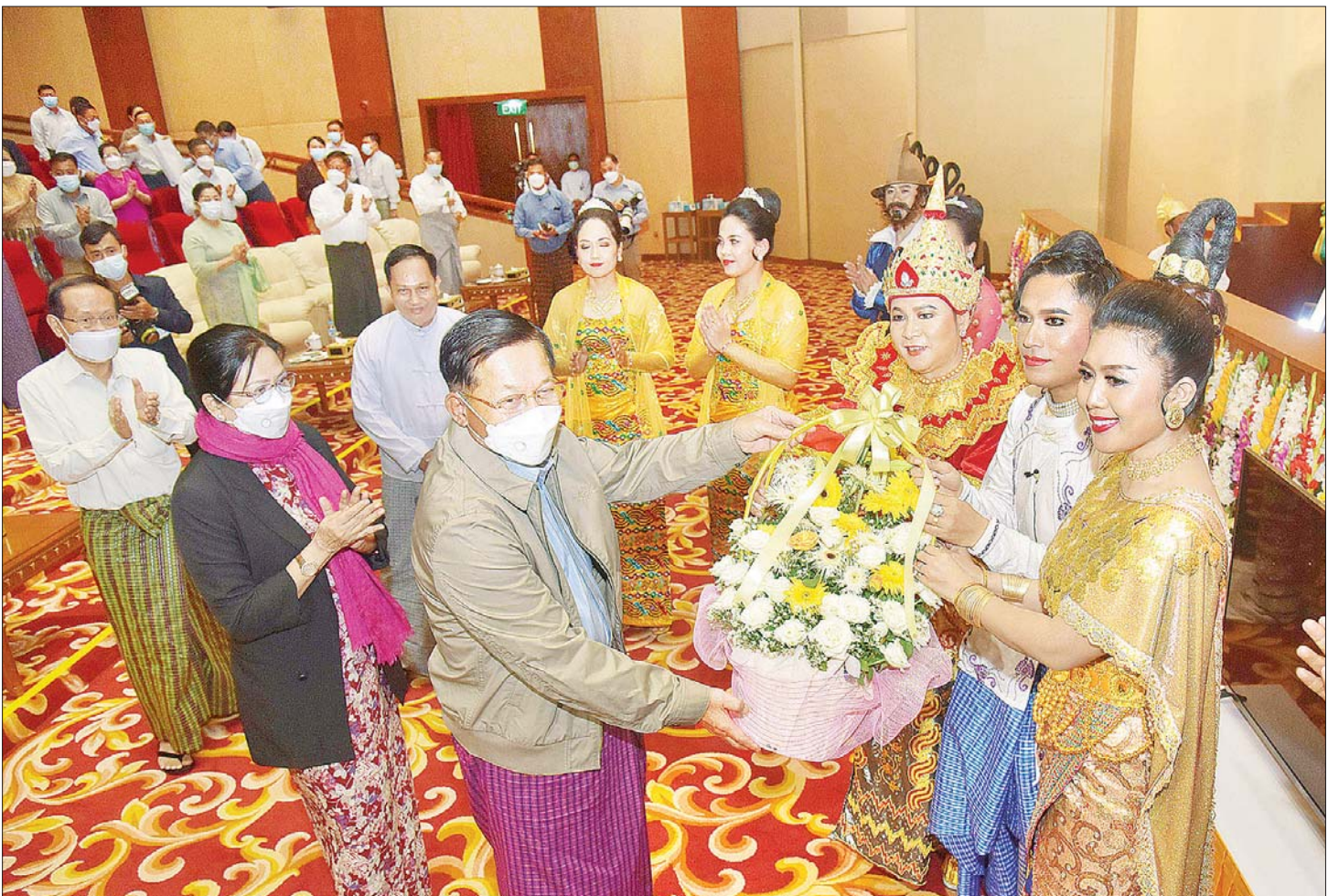
နိုင်ငံတော်စီမံအုပ်ချုပ်ရေးကောင်စီဥက္ကဋ္ဌ နိုင်ငံတော်ဝန်ကြီးချုပ် ဗိုလ်ချုပ်မှူးကြီး မင်းအောင်လှိုင်နှင့် ဇနီး ဒေါ်ကြူကြူလှတို့ ဇာတ်တော်ကြီးတွင် ပါဝင် တင်ဆက်ကပြဖျော်ဖြေခဲ့ကြသည့် အနုပညာရှင်များအား ဂုဏ်ပြုပန်းခြင်း ပေးအပ်ချီးမြှင့်စဉ်။

ဇာတ်တော်ကြီးကို မြန်မာ့ရိုးရာအစဉ်အလာ သမားစဉ်နှင့်အညီ ကပြဖျော်ဖြေရာတွင် ဘုရား ကန်တော့ခန်း၊ ဇာတ်တော်ကြီးသမားစဉ် အပျိုတော် ထွက်ခန်းနှင့် နှစ်ပါးသွားခန်းတို့ဖြင့် စတင်အစပျိုး ကပြဖျော်ဖြေသည်။ ထို့နောက် ဘုရင့်နောင် မင်းတရားကြီး ထွက်တော်မူကြီးနှင့် ဓာတုကလျာ ဖွားမြင်ခန်း၊ ဝန်မင်းနှစ်ပါး ဇာတ်ပဏ္ဍိတရိုက် ပြည်တည်ခန်း၊ မင်းရဲနန္ဒမိတ် ညီလာခံခန်း၊ နတ်သျှင် နောင် နောက်ကြောင်းပြန်ခန်း၊ နတ်သျှင်နောင်နှင့် ရာဇဓာတုကလျာတွေ့ဆုံခန်း၊ နတ်သျှင်နောင် ကိုယ်လုံပညာလေ့ကျင့်ခန်း၊ နတ်သျှင်နောင်မှ ရာဇ ဓာတုကလျာအား ချစ်ခွင့်ပန်ခန်း၊ နတ်သျှင်နောင်နှင့် ရာဇဓာတုကလျာ လက်ထပ်မည့်အကြောင်းအား ပြည်သူ့ ပြည်သားများ ပြောဆိုခန်း၊ နတ်သျှင်နောင် နှင့် ရာဇဓာတုကလျာလက်ထပ်ခန်း၊ နတ်သျှင်နောင် နှင့် ရာဇဓာတုကလျာ သစ္စာတိုင်ခန်းနှင့် ခွဲခွာခန်း၊ နတ်သျှင်နောင်မှ အယုဒ္ဓယတပ်များကို တိုက်ခိုက်ရန် ပြင်ဆင်ခန်း၊ နတ်သျှင်နောင် နောက်ကြောင်းပြန် ဇာတ်လမ်းနိဂုံးချုပ်ခန်း၊ ငဇင်ကာ အမြောက် လက်နက်ပြုလုပ်ခန်း၊ ငဇင်ကာနှင့် အပေါင်းပါများ အစည်းအဝေးပြုလုပ်ခန်း၊ နတ်သျှင်နောင်နှင့် ငဇင်ကာ တွေ့ဆုံခန်း၊ မင်းရဲနန္ဒမိတ်မှ တပ်မှူး ဗိုလ်မှူးများနှင့် တိုင်ပင်ခန်း၊ မင်းရဲနန္ဒမိတ်မှ သန်လျင်သို့ စစ်ချီခန်း၊ ပေါ်တူဂီတပ်များနှင့် အပေါင်းပါတောင်ငူတပ်များအား အင်းဝတပ်များက တိုက်ခိုက်ခန်း၊ မင်းရဲနန္ဒမိတ်မှ သန်လျင်မြို့အား သိမ်းပိုက်နိုင်ရေး ဥမင်လိုဏ်ခေါင်း ပြုလုပ်ရန် အမိန့်