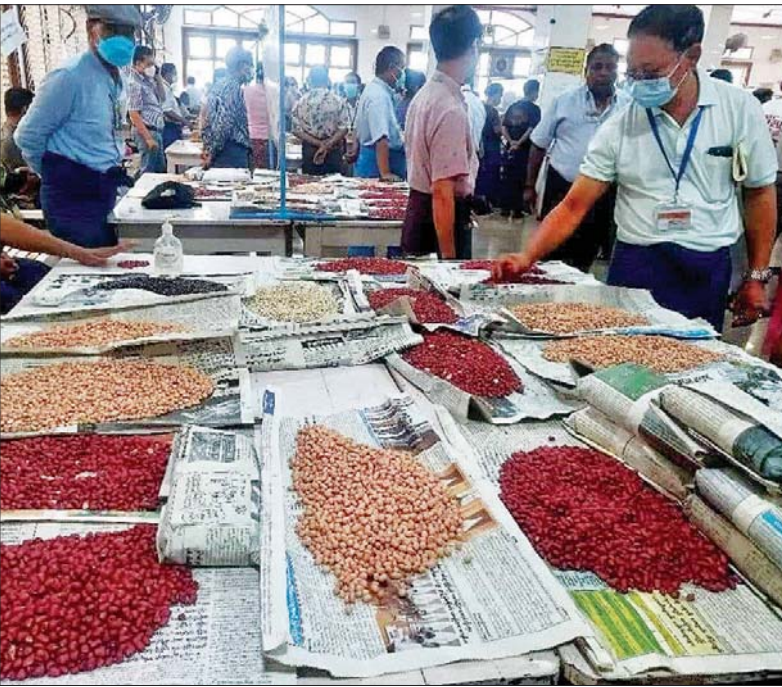
မန္တလေးကုန်စည်ခိုင်၌ ကုန်သည်များ ပဲဝယ်ယူရန် ကြည့်ရှုနေစဉ်။

မန္တလေး စက်တင်ဘာ ၂၄ မြန်မာထွက်ကုန် ကုလားပဲအုပ်စုဝင် ပဲများ ပြည်တွင်းပြည်ပဝယ်လိုအားကြောင့် မန္တလေးဈေးကွက်အတွင်း၌ ဈေးကောင်းများ ရရှိနေကြောင်း မန္တလေး ပဲကုန်သည်များထံမှ သိရသည်။ မန္တလေး ဈေးကွက်အတွင်း ကုလားပဲအုပ်စုဝင် ပဲအမျိုးအစားများ အနေဖြင့် V2၊ ထိုင်ဝမ်ကုလားပဲ၊ V7၊ 929၊ ဗမာကုလားပဲများဟူ၍ ရှိကြောင်း၊ ဈေးနှုန်းများအနေဖြင့် V2 သုံးတင်းဝင်တစ်အိတ်လျှင် ငွေကျပ် ၁၉၅၀၀၊ ထိုင်ဝမ်ကုလားပဲ သုံးတင်းဝင် တစ်အိတ်လျှင် ငွေကျပ် ၁၇၈၀၀၊ 929 ကုလားပဲ သုံးတင်းဝင်တစ်အိတ် လျှင်ငွေကျပ် ၁၈၃၀၀၊ ဗမာကုလားပဲ စာမျက်နှာ ၁၁ ကော်လံ ၄ ❖