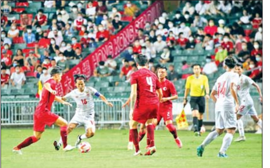
မြန်မာနှင့် ဟောင်ကောင် ယှဉ်ပြိုင်စဉ်။

ခြေစမ်းပြနေသူများဖြင့်သာ ထက် ကစားသမားသစ်များ ယှဉ်ပြိုင်ခဲ့သည်။ မြန်မာ့၏ ခြေစမ်းကို အဓိက လက်ရွေးစင် အသင်းသည် စမ်းသပ်ခဲ့ခြင်းဖြစ်သည်။ ယခုခြေစမ်းပွဲတွင် ရလဒ်ပိုင်း ရဲရင့်လွင်