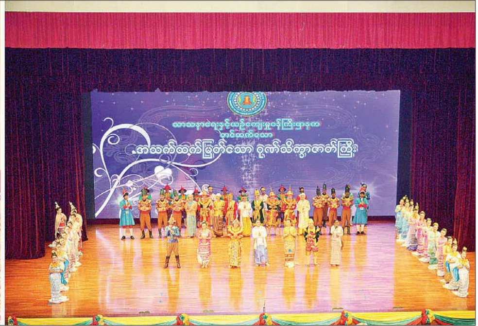
“အသက်ထက်မြတ်သော ဂုဏ်သိက္ခာ” ဆို ငို ပြော ဇာတ်တော်ကြီး တင်ဆက်ကပြဖျော်ဖြေရာ နိုင်ငံတော်စီမံအုပ်ချုပ်ရေးကောင်စီဥက္ကဋ္ဌ နိုင်ငံတော်ဝန်ကြီးချုပ် ဗိုလ်ချုပ်မှူးကြီး မင်းအောင်လှိုင်နှင့် ဇနီး ဒေါ်ကြူကြူလှ၊ နိုင်ငံတော်စီမံအုပ်ချုပ်ရေးကောင်စီဝင်များနှင့် ဇနီးများ၊ တာဝန်ရှိသူများ ကြည့်ရှုအားပေးစဉ်။