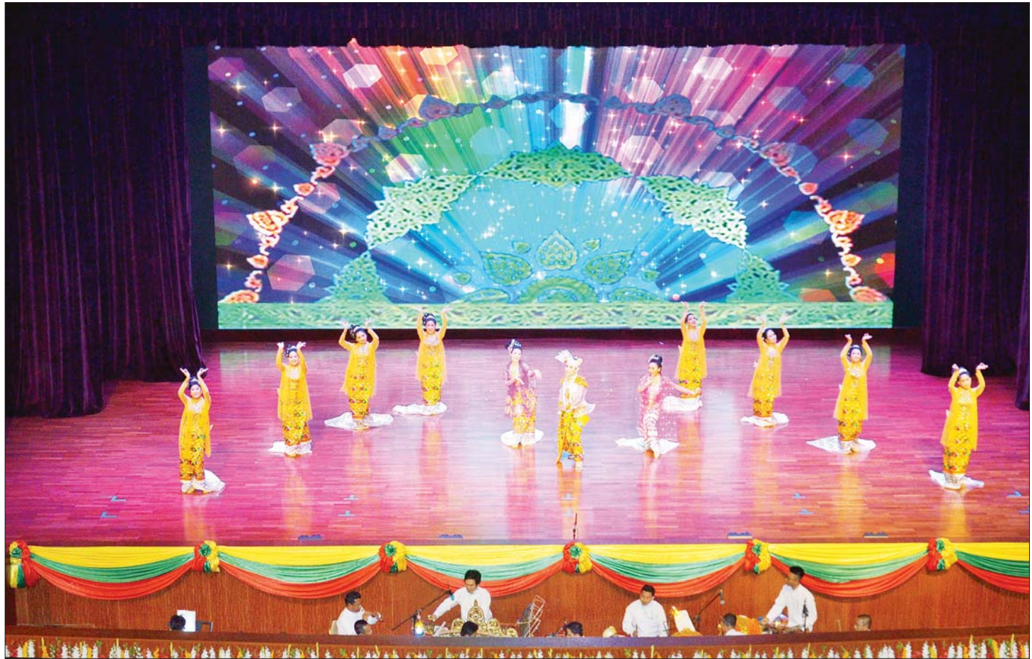
“အသက်ထက်မြတ်သော ဂုဏ်သိက္ခာ” ဆို ငို ပြော ဇာတ်တော်ကြီး တင်ဆက် ကပြဖျော်ဖြေစဉ်။

ဇာတ်တော်ကြီး ကပြဖျော်ဖြေတင်ဆက်မှုအပြီး တွင် နိုင်ငံတော်စီမံအုပ်ချုပ်ရေးကောင်စီ ဥက္ကဋ္ဌ နိုင်ငံတော်ဝန်ကြီးချုပ်နှင့် ဇနီးတို့သည် ဇာတ်တော် ကြီးတွင် ပါဝင်တင်ဆက်ကပြဖျော်ဖြေခဲ့ကြသည့် အနုပညာရှင်များအား ဂုဏ်ပြုပန်းခြင်းနှင့် ဂုဏ်ပြု ဆုငွေများကိုလည်းကောင်း၊ ပြည်ထောင်စုအဆင့် ပုဂ္ဂိုလ်များနှင့် ပြည်ထောင်စုဝန်ကြီးများ၊ ညွှန်ကြား ကွပ်ကဲရေးမှူး(ကြည်း၊ ရေ၊ လေ)၊ ကာကွယ်ရေးဦးစီး ချုပ်(ရေ)၊ ကာကွယ်ရေးဦးစီးချုပ်(လေ)နှင့် ကာကွယ် ရေးဦးစီးချုပ်ရုံး(ကြည်း)မှ ဒုတိယ ဗိုလ်ချုပ်ကြီးများက ဂုဏ်ပြုဆုငွေများကိုလည်းကောင်း အသီးသီးပေးအပ် ချီးမြှင့်ကာ ရင်းရင်းနှီးနှီး နှုတ်ဆက် အားပေးစကား ပြောကြားခဲ့ကြောင်း သတင်းရရှိသည်။ သတင်းစဉ်