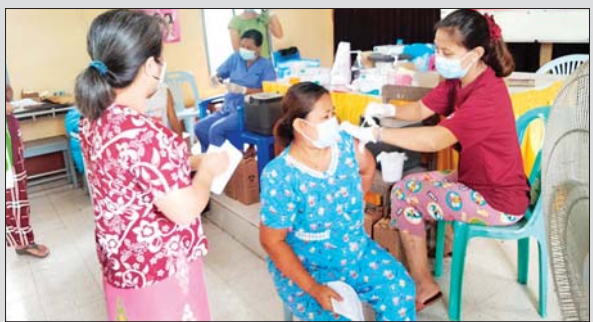
တောင်ဥက္ကလာပမြို့နယ်၌ ပြည်သူများအား ကိုဗစ်-၁၉ ကာကွယ်ဆေး ဆက်လက်ထိုးနှံပေး

ကာကွယ်ဆေးများ ထိုးနှံပေးလျက်ရှိရာ တွင် မြို့နယ်အတွင်းရှိ နိုင်ငံ့ဝန်ထမ်းများ၊ ဒေသခံပြည်သူများ၊ ဈေးသူ၊ ဈေးသားများ၊ အလုပ်သမားများနှင့် ကမ္ဘာ့ဝန်ထမ်းများအား တတိယအကြိမ်နှင့် စတုတ္ထအကြိမ် ထပ်ဆောင်း ကာကွယ်ဆေးများကို ကျန်းမာရေးဝန်ထမ်းများက စနေ၊ တနင်္ဂနွေ ရုံးပိတ်ရက်များမှအပ ကျန်ရက်များတွင် နေ့စဉ် ထိုးနှံပေးလျက်ရှိရာ ယနေ့အထိ ကိုဗစ်ကာကွယ်ဆေး ထိုးနှံပြီး သူပေါင်း တစ်သိန်းကျော်ရှိပြီး ဆေးထိုးရန်