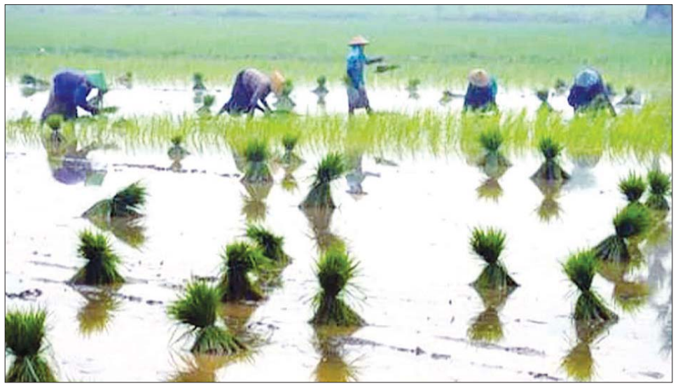
မန္တလေးတိုင်းဒေသကြီးမှ စပါးစိုက်ပျိုးနေသည့် တောင်သူများ။

ဟု ၎င်းကပြောသည်။ အဆိုပါချေးငွေမှာ စပါးသီးနှံနှင့် အခြားသီးနှံအတွက် ငွေကျပ်သိန်း ၂၀၀၀ နှင့် အထူးနေကြာစိုက်ပျိုးရန်အတွက် ငွေကျပ် ၂၂၄၀ သိန်းဖြစ်ပြီး ချေးငွေများကို အောက်တိုဘာလဒုတိယပတ်တွင် ထုတ်ချေးနိုင်မည်ဖြစ်ကာ လိုအပ်ချက်ရှိလာပါက ဆက်လက်လျာထားပြီး ချေးငွေထုတ်ချေးပေးမည်ဖြစ်ကြောင်း သိရသည်။ “စိုက်ပျိုးတောင်သူတွေကို နှစ်စဉ် မိုး၊ ဆောင်း၊ မိုးကြိုးချေးငွေ ချေးပေးဖို့လျာထားပြီး စပါးအတွက် တစ်ဧက ကျပ်တစ်သိန်းခွဲနဲ့ အခြားသီးနှံတွေကိုတော့ တစ်ဧက ကျပ်တစ်သိန်းနဲ့နဲ့ ထုတ်ချေးပါတယ်။ အတိုးနှုန်းကလည်း ၅ ရာခိုင်နှုန်းဖြစ်ပြီး သက်သာတဲ့နှုန်းထားပါ”ဟု ဆက်လက်ပြောကြားသည်။ ၂၀၂၂ ခုနှစ် မိုးရာသီ စိုက်ပျိုးစရိတ်ချေးငွေအဖြစ် မန္တလေးတိုင်းဒေသကြီးအတွင်း ၂၃ မြို့နယ်ရှိ တောင်သူများအား ငွေကျပ်သန်း ၅၀၀၀၀ ကျော် ထုတ်ချေးရန် လျာထားခဲ့ရာ ယနေ့အထိ မိုးရာသီသီးနှံချေးငွေကျပ် ၃၉၇၅၁ ဒသမ ၆ သန်း ထုတ်ချေး