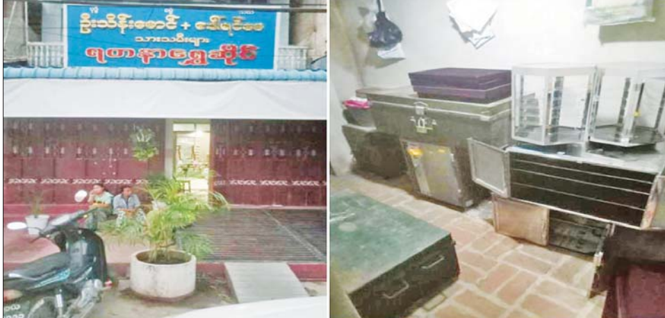
PDF အကြမ်းဖက်သမားများ သေနတ်ပြ ခြိမ်းခြောက်ကာ ရွှေထည်ပစ္စည်းများ လုယက်ယူဆောင်သွားသည့် ပခုက္ကူမြို့ အမှတ်(၁)ရပ်ကွက် မြို့မဈေးအနောက်ဘက်တန်းလမ်းရှိ ရတနာရွှေဆိုင် မှတ်တမ်းဓာတ်ပုံ။