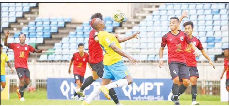
မဟာယူနိုက်တက်နှင့် GFA အသင်း ယှဉ်ပြိုင်နေစဉ်။

စစ်မှန်စည်းကမ်းပြည့်ဝတဲ့ ပါတီစုံဒီမိုကရေစီစနစ်ခိုင်မာရေး ဆောင်ရွက်ရာမှာ ပြည်သူတိုင်း၊ အဖွဲ့အစည်းတိုင်းက လိုက်နာ ဆောင်ရွက်ဖို့ အရေးကြီးပါတယ်။ ဒီလို ဆောင်ရွက်နိုင်မှ အောင်မြင်နိုင်မယ့် လုပ်ငန်းတစ်ခုလည်း ဖြစ်ပါတယ်။ ဒီလို ဖော်ဆောင်ရာမှာ ပထမဆုံး အခြေခံလိုအပ်ချက်ဖြစ်တဲ့ ဒီမိုကရေစီစနစ်ကိုဆန့်ကျင်ကာ ဒီမိုကရေစီလမ်းကြောင်းပေါ်မှ သွေဖည်သွားမယ့် လုပ်ဆောင်ချက်တွေ မလုပ်ဆောင်ဖို့ လိုအပ် ပါတယ်။ မည့်သည့်ပုဂ္ဂိုလ်၊ အဖွဲ့အစည်း၊ တာဝန်ထမ်းဆောင်မှု မျိုးကိုမဆို ဖွဲ့စည်းပုံအခြေခံဥပဒေနဲ့ ပြဋ္ဌာန်းထားတဲ့ ဥပဒေတွေ အတိုင်း လေးစားလိုက်နာ ဆောင်ရွက်ကြရမှာ ဖြစ်ပါတယ်။ (နိုင်ငံတော်စီမံအုပ်ချုပ်ရေးကောင်စီဥက္ကဋ္ဌ နိုင်ငံတော်ဝန်ကြီးချုပ် ဗိုလ်ချုပ်မှူးကြီး မင်းအောင်လှိုင်၏ ၂၀၂၂ ခုနှစ်၊ ဩဂုတ်လ ၁ ရက်နေ့တွင် နိုင်ငံတော်စီမံအုပ်ချုပ်ရေးကောင်စီ၏ ၁ နှစ်နှင့် ၆ လ (၁၈ လ) ပြည့် နိုင်ငံတော် တာဝန် ထမ်းဆောင်ခဲ့မှုနှင့် ပတ်သက်၍ ပြောကြားသည့်မိန့်ခွန်းမှ ကောက်နုတ်ချက်) ၁-၈-၂၀၂၂