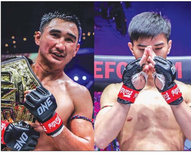
■ မိုးဇက် - စုစည်းသည်

ဝမ်းချန်ပီယံရှစ် ၁၆၁ မှ ဖယ်သာဝိတ်တန်း မွေထိုင်းကမ္ဘာ့ချန်ပီယံလုပွဲအဖြစ် လာမည့် စက်တင်ဘာ ၂၉ ရက်တွင် စင်ကာပူနိုင်ငံ၌ အကြိတ်အနယ် ယှဉ်ပြိုင်ကစားကြတော့မည် ဖြစ်သည်။ အဆိုပါ ဖယ်သာဝိတ်တန်း မွေထိုင်းကမ္ဘာ့ချန်ပီယံလုပွဲတွင် ဖယ်သာဝိတ်တန်းမွေထိုင်း ကမ္ဘာ့ချန်ပီယံဆုကို လေးကြိမ်ဆွတ်ခူးရရှိထားသည့် ပက်ချန်မိုရာကော့က ၎င်း၏ ခါးပတ်ကာကွယ်ပွဲအတွက် အားပါပြင်းထန်သော လက်သီးထိုးချက်များကြောင့် နာမည်ကြီးသည့် တာဝမ်ချိုင်နှင့် ထိုးသတ်သွားရမည် ဖြစ်သည်။ ထို့အပြင် ဟဲဗီးဝိတ်ကစားဘောက်ဆင်ကမ္ဘာ့ဂရုန်းပရီဆီမီးဖိုင်နယ် ပွဲစဉ်တွင် ယူကရိန်းနိုင်ငံသား ရိုမန် ကိုင်လီအာနှင့် ဘရာဇီး နိုင်ငံသား ဂူတို အင်အိုဆန်တီ၊ အီရန်နိုင်ငံသား အဇေပူအာနှင့် ဘရာဇီး နိုင်ငံသား ဘရူနို ချဗက်စ်တို့ ထိုးသတ်သွားမည်ဖြစ်သည်။