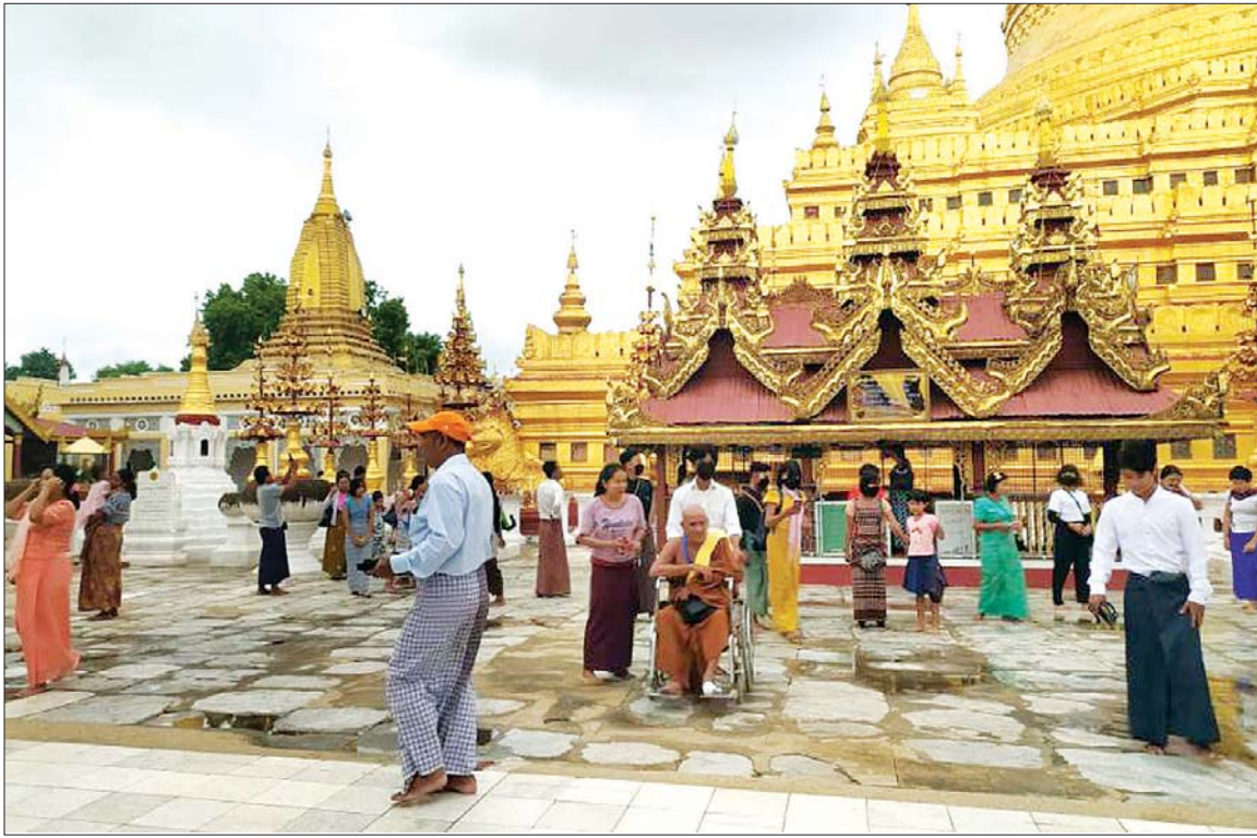
များသို့ လာရောက်ဖူးမြော်သူ ၇၀၀ မှ ၁၀၀၀ အထိ လာရောက်ကြကြောင်း၊ ညောင်ဦးမြို့နယ် စီမံအုပ်ချုပ်ရေးအဖွဲ့မှ စနေ၊ တနင်္ဂနွေရက်များတွင် ၁၀၀၀ သိရသည်။

ဘုရားဖူးလာသူများသည် ဟံပိုး၊ တကောင်း၊ တောင်ကြီး၊ ဟိုပုံး၊ နတ်မောက်၊ မကွေး၊ ပဲခူး၊ ပခုက္ကူ၊ ကျောက်ပန်းတောင်း၊ ရန်ကုန်၊ မန္တလေး၊ နေပြည်တော် စသည့် မြို့များမှဖြစ်ပြီး ပုဂံ-ညောင်ဦးသို့ လာရောက်ဘုရားဖူးရင်း ကျောက်ပန်းတောင်းမြို့နယ်ရှိ ပုပ္ပားတောင်ကလပ်သို့ လည်း တစ်ဆက်တစ်စပ်တည်း ဝင်ရောက်ကြကြောင်း၊ ပုဂံဒေသမှ သမိုင်းဝင်အထင်ကရ ဘုရားများဖြစ်သည့် တရင်တောင်စွယ်တော်မြတ်စေတီ၊ မေရုံကြီး၊ စူဠာမဏိ၊ ရွှေဆံတော်၊ ထီးလိုမင်းလို၊ ရွှေစည်းခုံ၊ မနုဿာ၊ အာနန္ဒာ၊ ဗူးဘုရား၊ အလိုတော်ပြည့်ကျောက်ဂူဥမင်၊ ပြာသာဒ်ကြီးဘုရား၊ သဗ္ဗညုဘုရားနှင့် ကန်တော့ပလ္လင်ဘုရားများသို့ လာရောက်ဖူးမြော်သူ ၇၀၀ မှ ၁၀၀၀ အထိ လာရောက်ကြကြောင်း၊ ညောင်ဦးမြို့နယ် စီမံအုပ်ချုပ်ရေးအဖွဲ့မှ စနေ၊ တနင်္ဂနွေရက်များတွင် ၁၀၀၀ သိရသည်။