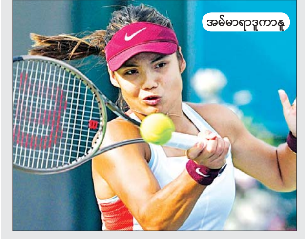
အမ်မာရာဒူကာနူ

ကိုရီးယားအိုးပင်းအမျိုးသမီးတစ်ဦးချင်းပြိုင်ပွဲ ကွာတားဖိုင်နယ်တွင် နာမည်ကြီး ဗြိတိန်တင်နစ်မယ် အမ်မာ ရာဒူကာနူသည် ကမ္ဘာ့အဆင့် ၅၁ ရှိ ပိုလန်တင်နစ်မယ် မက်ဂ်ဒါ လီနက်တီနှင့် ယှဉ်ပြိုင်ကစားခဲ့ပြီး အနိုင်ရရှိခဲ့သောကြောင့် အဆိုပါ ပြိုင်ပွဲ ဆီမီးဖိုင်နယ်သို့ တက်လှမ်းနိုင်ခဲ့သည်။ အဆိုပါပွဲစဉ်တွင် ရာဒူကာနူသည် ဗြိတိန်ကို ၆-၂၊ ၆-၂ ဖြင့် အနိုင်ရရှိကာ နောက်တစ်ဆင့်သို့ တက်ရောက်နိုင်ခဲ့ခြင်းဖြစ်သည်။ ရာဒူကာနူ၏ ယခုအနိုင်ပွဲသည် ၂၀၂၁ ခုနှစ်က ယူအက်စ်အိုးပင်း ပြိုင်ပွဲပြီးနောက် ပထမဆုံးအကြိမ် သုံးပွဲဆက်နိုင်ပွဲဖြစ်သည်။ ထို့ကြောင့် ရာဒူကာနူသည် ကိုရီးယားအိုးပင်းပြိုင်ပွဲ ဆီမီးဖိုင်နယ်တွင် အန်ဒိုရာတင်နစ်မယ် ဂျီမီနက်စ် ကာဆင့်ဆီဗာကို ၆-၂၊ ၆-၁ ဖြင့် အနိုင်ရရှိခဲ့သည့် လတ်ဗီးယားနာမည်ကြီး တင်နစ်မယ် အော့စတာပင်နာကိုနှင့် ယှဉ်ပြိုင်ကစားရမည် ဖြစ်သည်။ ရာဒူကာနူနှင့်အတူ ဗြိတိန်ကို အနိုင်ယူကာ ကိုရီးယားအိုးပင်းဆီမီးဖိုင်နယ်သို့ ဂျာမနီ တင်နစ်မယ် မာရီယာနှင့် အဲလက်စ် ဇန်ဒရီဗာတို့ တက်ရောက်နိုင်ခဲ့သည်။