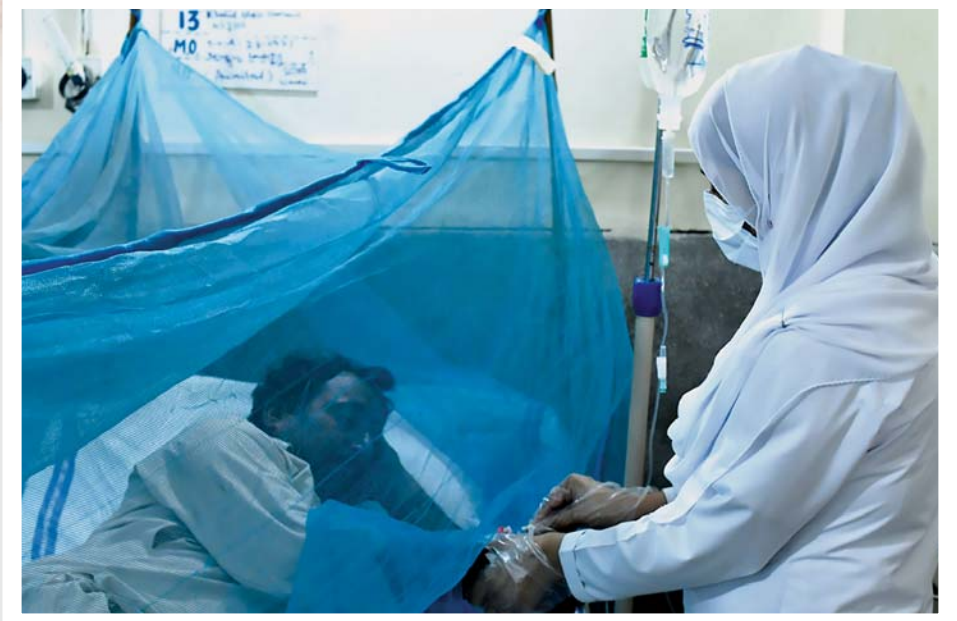
ပါကစ္စတန်နိုင်ငံ ပန်ဂျပ်ပြည်နယ်တွင် သွေးလွန်တုပ်ကွေးရောဂါ ခံစားနေရသည့် လူနာတစ်ဦး ဆေးကုသမှုခံယူနေစဉ်။

ပါကစ္စတန်နိုင်ငံတစ်ဝန်းရှိ ဆေးရုံများမှာ သွေးလွန်တုပ်ကွေးဖြစ်ပွားသူဦးရေ သိသိသာသာ မြင့်တက်လျက်ရှိတဲ့အတွက် ဖိအားတွေနဲ့ ရင်ဆိုင်ရလျက်ရှိပြီး ကရာချီမြို့မှ ကိုဗစ်-၁၉ ရောဂါကုသဆောင်အချို့ကို သွေးလွန်တုပ်ကွေးရောဂါကုသဆောင်အဖြစ် ပြောင်းလဲထားရကြောင်း ဒေသတွင်း မီဒီယာတွေရဲ့ ပြောကြားချက်အရ သိရပါတယ်။ ။