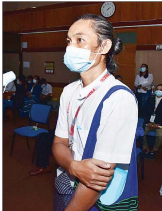
နောင်တော်လေး Myanmar National Post

တုံ့ပြောမီဒီယာမှ အယ်ဒီတာချုပ် ဦးဇော်မင်းဦး က ၂၀၁၀ ရွေးကောက်ပွဲအပြီး သမ္မတကြီး ဦးသိန်းစိန် က နိုင်ငံတော်သမ္မတတာဝန် ထမ်းဆောင်ခဲ့ကြောင်း၊ အလားတူ ၂၀၁၅ ရွေးကောက်ပွဲအပြီးတွင် သမ္မတ ဦးထင်ကျော်က နိုင်ငံတော်သမ္မတ တာဝန်ယူခဲ့ကြောင်း၊ ဖွဲ့စည်းပုံအခြေခံဥပဒေတွင် နိုင်ငံတော် သမ္မတသော်လည်းကောင်း၊ ဒုတိယသမ္မတ သော်လည်းကောင်း တစ်ဦးတစ်ယောက် အနားယူခဲ့လျှင် ရက်ပေါင်း ၃၀ အတွင်း လစ်လပ်သည့်နေရာ အား ပြန်လည်ရွေးချယ်ရမည်ဟုပါရှိကြောင်း၊ ထိုသို့ဆိုလျှင် သမ္မတနေရာအား ဒုတိယသမ္မတ(၁) ဦးမြင့်ဆွေမှ အတ္တတာဝန်ထမ်းဆောင်ပြီး ဒုတိယ သမ္မတ(၂)မှ ဒုတိယသမ္မတ(၁) နေရာအား ထမ်းဆောင်ရကြောင်း၊ ထို့ကြောင့်လစ်လပ်သွား သည့်မှာ ဒုတိယသမ္မတ(၂)နေရာဖြစ်ကြောင်း၊ အမှန်တကယ်ရွေးချယ်ရာတွင် ဒုတိယသမ္မတများ အားလုံးအထဲမှ မဲပေးသည့်စနစ်ဖြင့် ရွေးချယ်ခဲ့ ကြောင်း၊ ဒုတိယသမ္မတ(၁)ဖြစ်သည့် ဦးမြင့်ဆွေ သည် ဒုတိယသမ္မတ (၂)ဖြစ်သွားခဲ့ပါက ပြောစရာ ဖြစ်လာနိုင်ကြောင်း၊ ထို့ကြောင့် ယခုလအတွက် ရွေးကောက်ပွဲအပြီးတွင် ယင်းကိစ္စများနှင့် ပတ်သက် ပြီး ပြန်လည်ပြင်ဆင်ပေးရန် အစီအစဉ် ရှိ/မရှိ