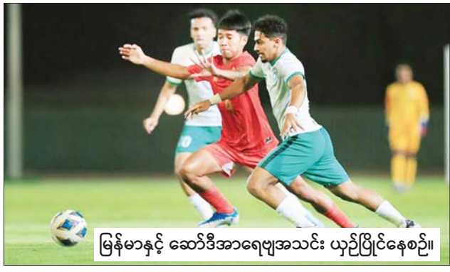
မြန်မာနှင့် ဆော်ဒီအာရေဗျအသင်း ယှဉ်ပြိုင်နေစဉ်။

ရန်ကုန် စက်တင်ဘာ ၁၇ ၂၀၂၃ အာရှဖလား ယူ-၂၀ ခြေစစ်ပွဲအုပ်စု (က) စတုတ္ထနေ့ အဖြစ် မြန်မာအသင်းနှင့် ဆော်ဒီအာရေဗျအသင်းတို့ မြန်မာစံတော်ချိန် စက်တင်ဘာ ၁၇ ရက် နံနက် ၁ နာရီက ဆော်ဒီအာရေဗျနိုင်ငံ၌ ယှဉ်ပြိုင်ကစားရာ ဆော်ဒီအာရေဗျအသင်းက ငါးဂိုးပြတ် အနိုင်ရခဲ့သည်။