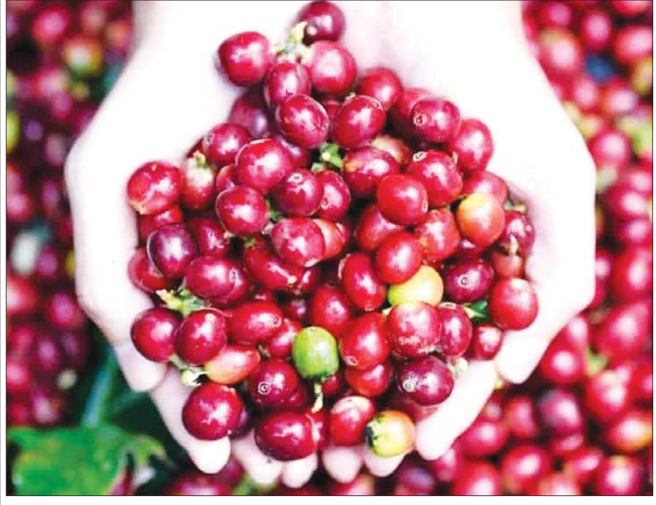
ဈေးကွက်ရောင်းတမ်းဝင် ကော်ဖီသီးများကို တွေ့ရစဉ်။

အနှစ်ချုပ်တင်ပြရလျှင် ကော်ဖီသည် အရင်းအနှီးကြီးသော်လည်း စိုက်ပျိုးသင့်သော သီးနှံပင် တစ်မျိုးဖြစ်သည်။ နှစ်ရှည်သီးနှံမျိုး ဖြစ်သော ကြောင့် သက်တမ်း ၁၆ နှစ်အထိ တောင်သူကို အမြတ်များများရအောင် ဝင်ငွေရှာပေးသော သီးနှံမျိုးလည်း ဖြစ်သည်။ ထို့ပြင် နိုင်ငံခြားဈေးကွက်ရှိနေသဖြင့် နိုင်ငံတစ်ဝန်းမှ တောင်သူများအနေဖြင့် လက်ရှိ စိုက်ပျိုးနေသော ဇန်နယ်မြေအလိုက် စိုက်ဧကများ ပိုမိုတိုးချဲ့စိုက်ပျိုးကြရန် လိုပါသည်။ ကော်ဖီမှ နိုင်ငံခြားဝင်ငွေရရှိလာပါလျှင် နိုင်ငံစီးပွား ဖွံ့ဖြိုးတိုးတက် စည်ပင်လာမည်ဖြစ်သည်။ ကော်ဖီစိုက်ပျိုးသူ တောင်သူများအနေဖြင့်လည်း ဝင်ငွေတိုးပွားအကျိုးများပြီး လူမှုစီးပွားဘဝများ ဖွံ့ဖြိုးတိုးတက်လာမည်မှာ ဧကန်မလွဲဖြစ်ပါသည်။ နိုင်ငံတစ်ဝန်း ကော်ဖီစိုက်ဧကများ တိုးတက်လာပါက ကော်ဖီတစ်ခေတ် ဆန်းသစ်လာမည်ဖြစ်၍ နိုင်ငံခြားဝင်ငွေရရှိဖို့ ကော်ဖီသီးနဲ့ တိုးချဲ့စိုက်ပျိုးကြပါစို့ဟု နှိုးဆော်တိုက်တွန်း ရေးသားတင်ပြလိုက် ရပေသည်။ ။