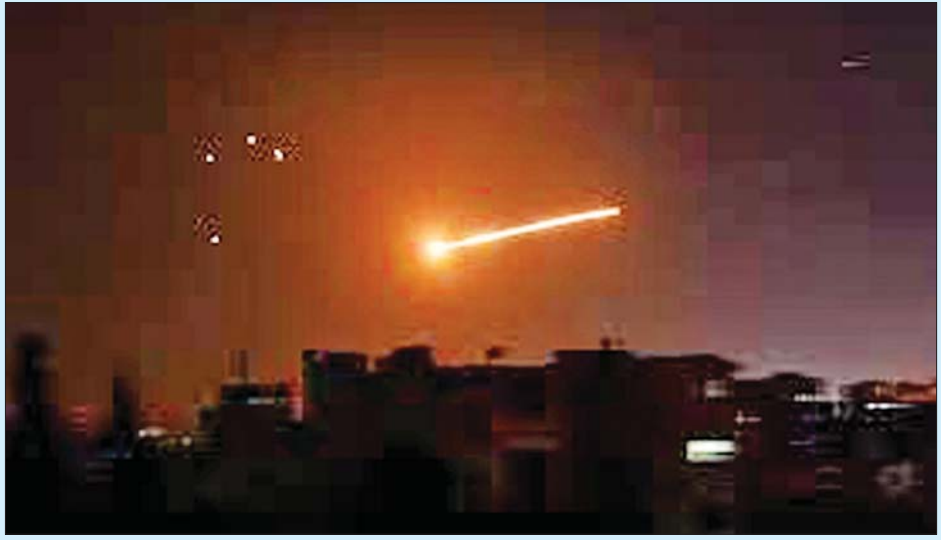
ထိုခိုက်ဒဏ်ရာရရှိသူ ၂၃ ဦးရှိကြောင်း သိရသည်။ များ၊ ဌာနချုပ်များနှင့် ယာဉ်များအပါအဝင် ပစ်မှတ် ထိုးအပြင် အစွရေးနိုင်ငံ၏ အဆိုပါပစ်ခတ် တိုက်ခိုက်မှုအတွင်း အဆောက်အအုံများ၊ ဂိုဒေါင် လေ့လာစောင့်ကြည့်ရေးအဖွဲ့က ပြောသည်။ဆင်ဟွာ

တိုက်ခိုက်ခဲ့ကြောင်း သိရသည်။ ပေါက်ကွဲသံများ ကျယ်လောင်စွာ ကြားရသော်လည်း အသေးစိတ် အချက်အလက်များကိုမူ ဖော်ပြထားခြင်း မရှိပေ။ အစွရေး၏ အဆိုပါ တိုက်ခိုက်မှုသည် လက်ဘနွန် အခြေစိုက်ရိုးယိုက်လှုပ်ရှားမှုနှင့် ဟစ်ဘိုလာတို့ ရှိရာ ဒမတ်စကတ်မြို့တောင်ပိုင်း ကျေးလက် ဒေသနှင့် ဆေရီဒါနီနက် ဒေသတို့ကို ပစ်မှတ်ထား တိုက်ခိုက်ခြင်းဖြစ်ကြောင်း ဆီးရီးယားလူ့အခွင့်အရေးလေ့လာစောင့်ကြည့်ရေးအဖွဲ့က ပြောသည်။ အစွရေးနိုင်ငံသည် ယခုနှစ်အတွင်း ဆီးရီးယား နိုင်ငံတွင်းသို့ ခုံးကျည်ပစ်ခတ်မှု ၂၅ ကြိမ် ပြုလုပ်ခဲ့ပြီး အစိုးရစစ်သား ၂၇ ဦးသေဆုံးကာ အရပ်သား