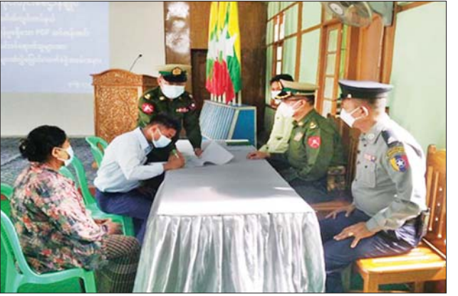
အဖွဲ့ဝင်များက တိုင်းဒေသကြီးနှင့် ရှိသူများက ၎င်းတို့၏ မိဘ ပြည်နယ်အသီးသီး၌ ဥပဒေဘောင် အတွင်း ပြန်လည်ဝင်ရောက်လျက် အပ်နှံပေးလျက်ရှိကြောင်း သိရ ရှိကြသဖြင့် သက်ဆိုင်ရာတာဝန် သည်။ သတင်းစဉ်

များ ပေးအပ်ပြီး ၎င်းတို့၏ မိဘ အုပ်ထိန်းသူများထံသို့ လွှဲပြောင်း အပ်နှံပေးကြသည်။ PDF အပါအဝင် အဖွဲ့အစည်း အမျိုးမျိုးတို့အနေဖြင့် နိုင်ငံတော် ၏ ရှေ့လုပ်ငန်းစဉ်များတွင် ပါဝင် ပူးပေါင်း ဆောင်ရွက်နိုင်ရေး သတ်မှတ်စည်းကမ်းချက်များနှင့် အညီ ဥပဒေဘောင်အတွင်းသို့ လက်နက်အပ်နှံပြီး ပြည်သူ့ဘဝသို့ ပြန်လည်ဝင်ရောက်ခြင်း ပြုမည် ဆိုပါက ကြိုဆိုလက်ခံသွားမည် ဖြစ်ကြောင်း နိုင်ငံတော်အစိုးရက ထုတ်ပြန်ထားပြီးဖြစ်ရာ ပြစ်မှု ကျူးလွန်ခြင်းမရှိသော PDF