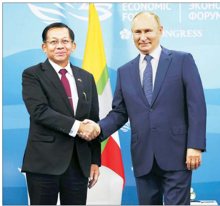
နိုင်ငံတော်စီမံအုပ်ချုပ်ရေးကောင်စီ ဥက္ကဋ္ဌ နိုင်ငံတော်ဝန်ကြီးချုပ် ဗိုလ်ချုပ်မှူးကြီး မင်းအောင်လှိုင်အား ရုရှားဖက်ဒရေးရှင်းနိုင်ငံသမ္မတ H.E. Vladimir Vladimirovich Putin က ရင်းရင်းနှီးနှီး နှုတ်ဆက်စဉ်။

သမိုင်းကြောင်းရှိသည့် ဆက်ဆံရေး နိုင်ငံတော်စီမံအုပ်ချုပ်ရေးကောင်စီ ဥက္ကဋ္ဌ နိုင်ငံတော်ဝန်ကြီးချုပ်ကလည်း အပြန်အလှန် ကျေးဇူးတုံ့ပြန်စကားဖြင့် စသည်။ နှစ်နိုင်ငံ သံတမန်ဆက်ဆံရေး ကာလကို ညွှန်းဆိုရင်း ထူးခြားသည့် သမိုင်းကြောင်းရှိသည့် ဆက်ဆံရေး အဖြစ် ဂုဏ်ပြုစကားဆိုသည်။ အနိမ့်၊ အမြင့်မျိုးစုံသော ဆက်ဆံရေးသမိုင်းနှင့် လွန်ခဲ့သော ၁၀ စုနှစ် နှစ်စုကျော်ကာလမှ စတင်၍ နှစ်နိုင်ငံဆက်ဆံရေးတိုးတက် လာမှုကို အရှိန်အဟုန်ဖြင့် ဟူသော အထူးပြု စကားလုံးဖြင့် ညွှန်းဆိုသည်။ လွန်ခဲ့သည့် နှစ် ၃၀ ခန့်တွင် ရုရှားနိုင်ငံ ရင်ဆိုင်ခဲ့သည့် အခက်အခဲအပေါ် လက်ရှိ သမ္မတကြီးတာဝန်ယူသည့် ၁၀ စုနှစ် ကာလအတွင်း ကမ္ဘာ့ထိပ်တန်းနိုင်ငံ အဖြစ် ရောက်ရှိလာမှု၊ ကမ္ဘာ့ထိပ်တန်းသို့ ရောက်ရှိလာမှုနှင့်အတူ ကမ္ဘာ့အရေးကိစ္စ များတွင် ရပ်တည်ဆောင်ရွက်နေမှုများကို ဂုဏ်ပြုစကားဖြင့် ဖော်ပြသည်။ လာမည့် အနာဂတ်ကာလတွင် ရုရှားနှင့်မြန်မာနှစ် နိုင်ငံအကြား ကဏ္ဍပေါင်းစုံတွင် ပူးပေါင်း ဆောင်ရွက်မှုအား ဆက်လက်ပူးပေါင်း ဆောင်ရွက်သွားမည်ဆိုသည်ကိုလည်း ထည့်သွင်းပြောဆိုသည်။ ကဏ္ဍတစ်ခု တည်း၊ အနည်းငယ်မျှသောကဏ္ဍ၊ ကဏ္ဍ အချို့ စသည့် ကန့်သတ်ချက်မပါ။ ကဏ္ဍ ပေါင်းစုံဟု သုံးနှုန်းသည်။ စီးပွားရေး၊