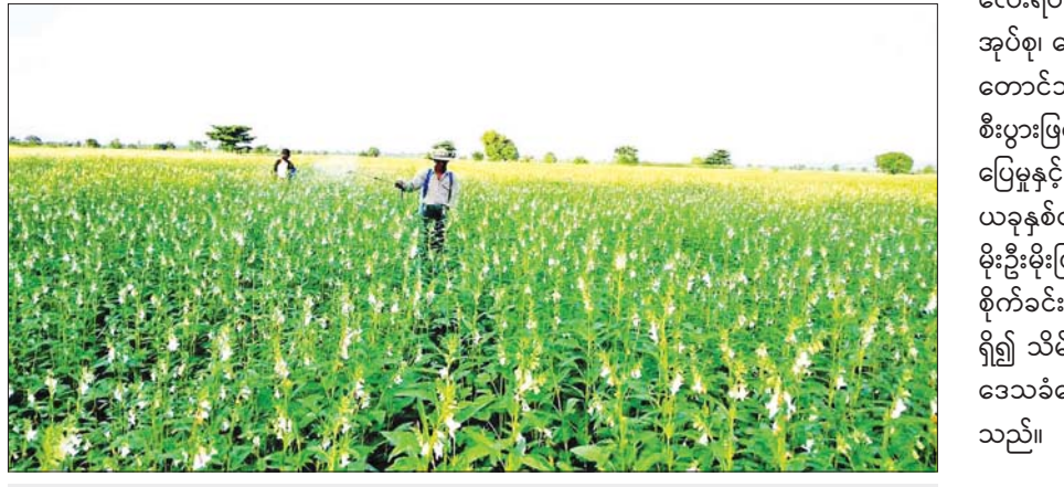
မိုးနှမ်းစိုက်ခင်းအတွင်း တောင်သူများ ပိုးသတ်ဆေးဖျန်းနေစဉ်။

ရောဂါ ကျရောက်မှုမရှိစေရေး ကြိုတင် ကာကွယ်နှိမ်နင်းရမည့်နည်းစနစ်များကို ပံ့ပိုး ကူညီဖြည့်ဆည်းဆောင်ရွက်ပေးလျက် ရှိပါ တယ်။ ဒါ့အပြင် မျိုးစေ့ထုတ်နည်းပညာ ဖြန့်ဝေပေးခြင်းနဲ့ စံပြကွက်များစိုက်ပျိုး သရုပ်ပြခြင်းများကို ဆောင်ရွက်လျက် ရှိပါ တယ်။ ကျွန်ုပ်တို့ဒေသမှာ စပုံနက်၊ နှမ်းဖြူ၊ နှမ်းနီနဲ့ သိပ္ပံနှမ်းနက်တွေကို အများဆုံးစိုက်ပျိုး ကြပါတယ်။ အခုနှစ်မှာ မိုးနှမ်းစံပြကွက် စိုက်ပျိုးမှုအနေနဲ့ ပွင့်ဖြူမြို့နယ် ဖလံတော ကျေးရွာက ဒေသခံတောင်သူ ၁၁ ဦးရဲ့ လယ်မြေ မှာ မိုးနှမ်းထရိုင်ခိုခါးမားထည့်သွင်းခြင်း စံပြ ကွက်အဖြစ် ၁၅ ဧကကိုလည်း စိုက်ပျိုးထားပြီး ဖြစ်ပါတယ်” ဟု ပြောသည်။ ပွင့်ဖြူမြို့နယ်သည် မြို့ပေါ်ရပ်ကွက် လေးရပ်ကွက် အပါအဝင် ကျေးရွာအုပ်စု ၅၆ အုပ်စု၊ ကျေးရွာပေါင်း ၂၀၅ ရွာရှိပြီး ဒေသခံ တောင်သူများသည် စိုက်ပျိုးရေးလုပ်ငန်းကို စီးပွားဖြစ်လုပ်ကိုင်ကြကာ စိုက်ပျိုးရေးအဆင် ပြေမှုနှင့် ရာသီဥတုမျှတကောင်းမွန်မှုကြောင့် ယခုနှစ်တွင်လည်း ဒေသခံတောင်သူများ မိုးဦးမိုးဖြင့် စိုက်ပျိုးထားရှိသည့် မိုးနှမ်း စိုက်ခင်းများမှာ အောင်မြင်ဖြစ်ထွန်းလျက် ရှိ၍ သိမ်းဆည်းချိန်တွင် ဈေးကောင်းရရန် ဒေသခံတောင်သူများက မျှော်လင့်နေကြ သည်။