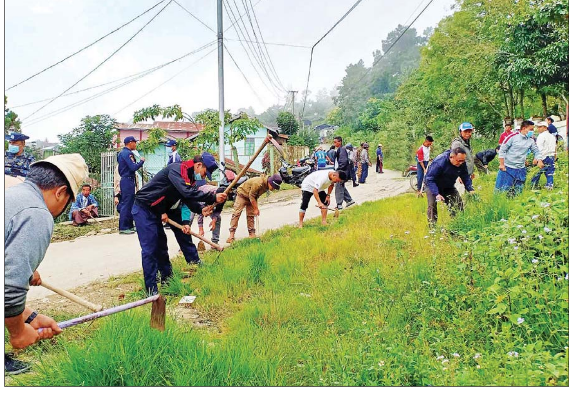
တီးတိန်မြို့ သန့်ရှင်းသာယာလှပရေး စုပေါင်းသန့်ရှင်းရေးဆောင်ရွက်စဉ်။

နေပြည်တော် စက်တင်ဘာ ၁၇ ယခုအချိန်အခါတွင် နိုင်ငံတော်စီမံအုပ်ချုပ်ရေးကောင်စီ၏ ဦးဆောင်မှုနှင့်အတူ နိုင်ငံတစ်ဝန်းလုံး၌ အုပ်ချုပ်ရေးအဖွဲ့အစည်းများ၊ ဒေသခံပြည်သူများအားလုံးက နိုင်ငံတော် ဖွံ့ဖြိုးတိုးတက်ရေးလုပ်ငန်းများကို ညီညီညွတ်ညွတ်ဖြင့် ဆောင်ရွက်လျက်ရှိကြပြီး အပတ်စဉ်စနေနေ့တိုင်းတွင်လည်း မိမိတို့၏ မြို့၊ ရွာဒေသများ သန့်ရှင်းသာယာလှပရေးကို အားတက်သရော ဆောင်ရွက်လျက်ရှိကြသည်။ ထိုသို့ဆောင်ရွက်လျက်ရှိရာ ယနေ့တွင် နေပြည်တော် ကောင်စီနယ်မြေ ဇေယျာသီရိမြို့နယ်အပါအဝင် မြို့နယ်ရှစ်မြို့နယ် တို့၌လည်းကောင်း၊ ကချင်ပြည်နယ် မြစ်ကြီးနားမြို့နယ်အပါအဝင် မြို့နယ်သုံးမြို့နယ်တို့၌ လည်းကောင်း၊ ရှမ်းပြည်နယ် (မြောက်ပိုင်း) လားရှိုးမြို့နှင့် ကွတ်ခိုင်မြို့တို့၌ လည်းကောင်း၊ ရှမ်းပြည်နယ်(တောင်ပိုင်း) ခိုလမ်မြို့နယ်အပါအဝင် မြို့နယ်သုံးမြို့နယ်တို့၌ လည်းကောင်း၊ စာမျက်နှာ ၁၁ ကော်လံ ၁ □