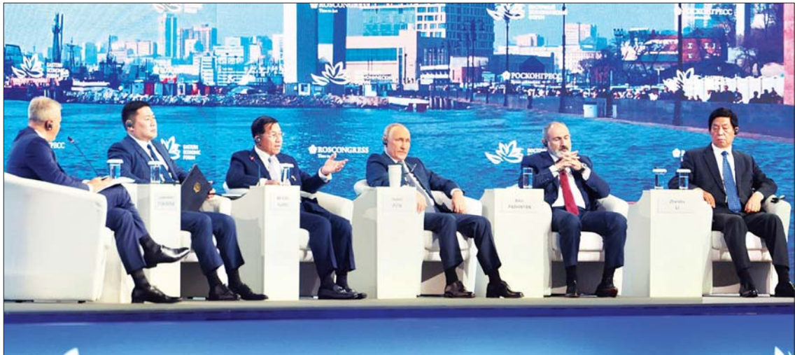
နိုင်ငံတော်စီမံအုပ်ချုပ်ရေးကောင်စီဥက္ကဋ္ဌ နိုင်ငံတော်ဝန်ကြီးချုပ်၏ ဆွေးနွေးမှုနှင့်ပတ်သက်၍ အခမ်းအနားမှူးက သိရှိလို သည်များကို ပြန်လည်မေးမြန်းဆွေးနွေး ပြောကြားခဲ့ရာ နိုင်ငံတော်စီမံအုပ်ချုပ်ရေးကောင်စီဥက္ကဋ္ဌ နိုင်ငံတော်ဝန်ကြီးချုပ် ဗိုလ်ချုပ်မှူးကြီး မင်းအောင်လှိုင်က ပြန်လည်ရှင်းလင်းဆွေးနွေးစဉ်။

နိုင်ငံတော်စီမံအုပ်ချုပ်ရေးကောင်စီ ဥက္ကဋ္ဌ နိုင်ငံတော်ဝန်ကြီးချုပ် ဗိုလ်ချုပ် မှူးကြီး မင်းအောင်လှိုင်၏ တစ်နေ့တာ လှုပ်ရှားဆောင်ရွက်မှု၊ တွေ့ဆုံဆွေးနွေးမှု များက အစီအစဉ်အားဖြင့် ပြီးမြောက်ခဲ့ပြီ ဖြစ်သည်။ အစီအစဉ်အရ ပြီးမြောက်ခြင်း ၏ နောက်ဆက်တွဲ အကျိုးကျေးဇူးများ ကား မပြီးဆုံးသေး။ အချို့အကြောင်း အရာများက တိုးတက်မှုအဖြစ် ရှိနေပြီး အချို့အကြောင်းအရာများမှာ အသစ် အသစ်သော၊ ကောင်းမွန်သောအရာများ အဖြစ် စတင်သက်ဝင်လာပြီဖြစ်သည်။ တိုးတက်မှု၊ ဖွံ့ဖြိုးမှု၊ ကြီးပွားမှုအစရှိသည့် အပြုသဘောဆောင် တိုးတက်မှုများမှာ တိုင်းတာကြည့်ရန်ပင် ခက်ခဲလွန်းလှ သည် ထင်သည်။ မည်သို့ပင် ဆိုစေကာမူ အဓိမြန်မာပြည်အတွက် အပြုသဘော ဆောင် တိုးတက်မှုမှန်သမျှ အတိုင်း အဆမရှိခြင်းသည်ပင် မင်္ဂလာမည်ပါ ပေသည်ဟု သုံးသပ်ဖော်ပြအပ် ပါသည်။ ။