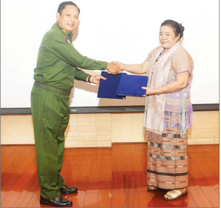
နိုင်ငံတော်စီမံအုပ်ချုပ်ရေးကောင်စီအဖွဲ့ဝင် ဒုတိယဗိုလ်ချုပ်ကြီး မိုးမြင့်ထွန်းနှင့် ကရင်အမျိုးသားအစည်းအရုံး/ ကရင်အမျိုးသားလွတ်မြောက်ရေးတပ်မတော်-ငြိမ်းချမ်းရေးကောင်စီ (KNU/KNLA-PC) ဒုတိယဥက္ကဋ္ဌ ဒေါက်တာနော်ကပေါ်ထူးတို့ သဘောတူညီချက်များကို အတည်ပြုလက်မှတ်ရေးထိုး လဲလှယ်ကြသည်။