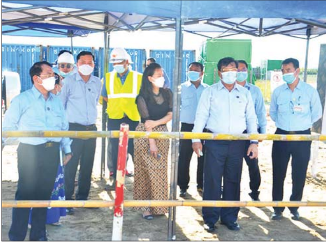
အောင်မြင်အောင် စေတနာထား၍ ပိုင်းဝန်းဆောင်ရွက်သွားကြရန် မှာကြားသည်။

ဆက်လက်၍ ပြည်ထောင်စုဝန်ကြီးက တိုင်းဒေသကြီးအတွင်း လျှပ်စစ်ဓာတ်အား တိုးမြှင့်ဖြန့်ဖြူးပေးနိုင်ရေး၊ ဓာတ်အားပျောက်ဆုံး မှုနှင့် ဓာတ်အားပြတ်တောက်မှု လျော့နည်းကျဆင်းရေး၊ ပြည်သူ လူထုအတွက် အရည်အသွေးပြည့်ဝသည့် လျှပ်စစ်ဓာတ်အားများ ဖြန့်ဖြူးပေးနိုင်ရေး၊ လျှပ်စစ်ဓာတ်အားခကျသင့်ငွေများ အပြည့်အဝ ကောက်ခံရရှိစေရေး ခရိုင်/မြို့နယ်လျှပ်စစ်အင်ဂျင်နီယာများ၊ ဘဏ္ဍာ ရေး တာဝန်ခံများမှ ဆောင်ရွက်သွားရန်နှင့် မိတာဖတ်ခြင်း၊ မိတာ ဘေလ်ခေခြင်းနှင့် ဓာတ်အားခကောက်ခံခြင်းလုပ်ငန်းများကိုလည်း လုံခြုံရေးပြည့်ပြည့်ဝဝဖြင့် တက်ညီလက်ညီ ပိုင်းဝန်းကြိုးပမ်း ဆောင်ရွက်သွားကြရန်၊ ၎င်းအပြင် မိမိတို့ဝန်ကြီးဌာနသည် ပြည်သူကို ဝန်ဆောင်မှုပေးနေသော ဌာနဖြစ်သည့်အလျောက် ပြည်သူလူထု၏ လျှပ်စစ်ဓာတ်အားလိုအပ်ချက်များအပေါ် အတတ်နိုင်ဆုံး ဖြည့်ဆည်း ဆောင်ရွက်ပြီး အကောင်းဆုံးဝန်ဆောင်မှုပေးနိုင်ရေး ကြိုးပမ်း ဆောင်ရွက်သွားကြရန်နှင့် မိမိတို့ဝန်ကြီးဌာန၏ ရည်မှန်းချက်များ