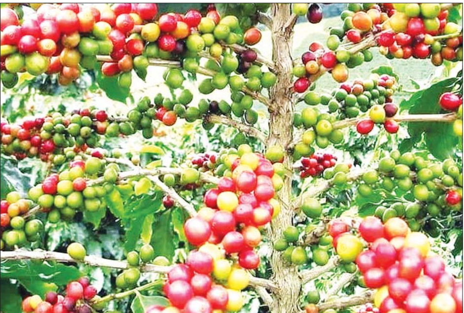
စိုက်ပျိုးအောင်မြင်နေသော ကော်ဖီပင်တစ်ပင်မှ ကော်ဖီသီးများ။

မြန်မာနိုင်ငံ၌ စိုက်ပျိုးသောကော်ဖီ နှစ်မျိုး မြန်မာနိုင်ငံ၌ စိုက်ပျိုးသောကော်ဖီမှာ နှစ်မျိုး နှစ်စားရှိသည်။ လွယ်လွယ်မှတ်မည်ဆိုလျှင် တောင်ပေါ်၌ စိုက်ပျိုးသော ကော်ဖီ (တောင်ပေါ်