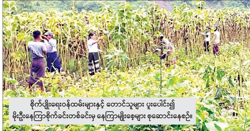
စိုက်ပျိုးရေးဝန်ထမ်းများနှင့် တောင်သူများ ပူးပေါင်း၍ မိုးဦးနေကြာစိုက်ခင်းတစ်ခင်းမှ နေကြာမျိုးစေ့များ စုဆောင်းနေစဉ်။

မင်းတုန်းမြို့နယ်၌ ယခုနှစ်တွင် မိုးဦးနေကြာသီးသန့်နှင့်သီးညှပ် ၁၄၅ ဧက စိုက်ပျိုးနိုင်ခဲ့ကာ မိုးလယ်နှင့်ဆောင်းတွင် နေကြာသီးသန့်နှင့်သီးညှပ် ၇၀၅၃ ဧက စိုက်ပျိုးရန် လျာထားပြီး နေကြာမျိုးစေ့ ၁၂၇၁ ဒဿမ ၅ တင်း လိုအပ်မည်ဖြစ်သည်။