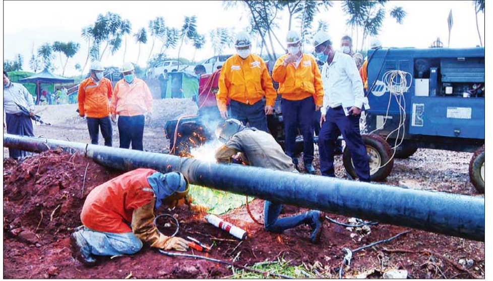
ကြောင်း မှာကြားပြီး ပင်းပက်ဓာတ်ငွေ့ထိန်းဖြန့်စခန်း ပိုက်အစားထိုးလဲလှယ်ခြင်း လုပ်ငန်းဆောင်ရွက် ရှိ သဘာဝဓာတ်ငွေ့ဖိအားမြှင့်စက်များ ဖိအား နေမှုများကို ကြည့်ရှုစစ်ဆေးခဲ့ကြောင်း သိရ စမ်းသပ်စစ်ဆေးခြင်းလုပ်ငန်း ဆောင်ရွက်နေမှု သည်။ (အပေါ်ပုံ) သတင်းစဉ်

ရှမ်းပြည်နယ်တောင်ပိုင်း တောင်ကြီးမြို့အနီးရှိ ပင်းပက်သဘာဝဓာတ်ငွေ့ ထိန်းဖြန့်စခန်းသို့ရောက်ရှိ စစ်ဆေးပြီး ပြည်ထောင်စုဝန်ကြီးက သံမဏိစက်ရုံပြန်လည်လည်ပတ်ချိန်တွင် စက်ရုံသို့ သဘာဝဓာတ်ငွေ့ပို့လွှတ်ပေးနိုင်ရေး လိုအပ်သောကြိုတင်ပြင်ဆင်မှုများ ဆောင်ရွက်ထားရန်လိုကြောင်း၊ စက်ရုံအတွက် လိုအပ်သော သဘာဝဓာတ်ငွေ့ဖြည့်ဆည်းနိုင်ရေးအတွက် ရွှေစီမံကိန်းမှပြည်တွင်းသုံး သဘာဝဓာတ်ငွေ့ဖြန့်ဖြူးပေးနိုင်ရေး ညှိနှိုင်းဆောင်ရွက်ထားရန်လိုကြောင်း၊ ပိုက်လိုင်းများ အဆင့်မြှင့်တင်ခြင်း၊ အစားထိုးလဲလှယ်ခြင်းလုပ်ငန်းများကို သတ်မှတ်ထားသော စံချိန်စံညွှန်းများနှင့်အညီ အချိန်မီပြီးစီးနိုင်ရေး အလေးထားဆောင်ရွက်သွားကြရမည်ဖြစ်