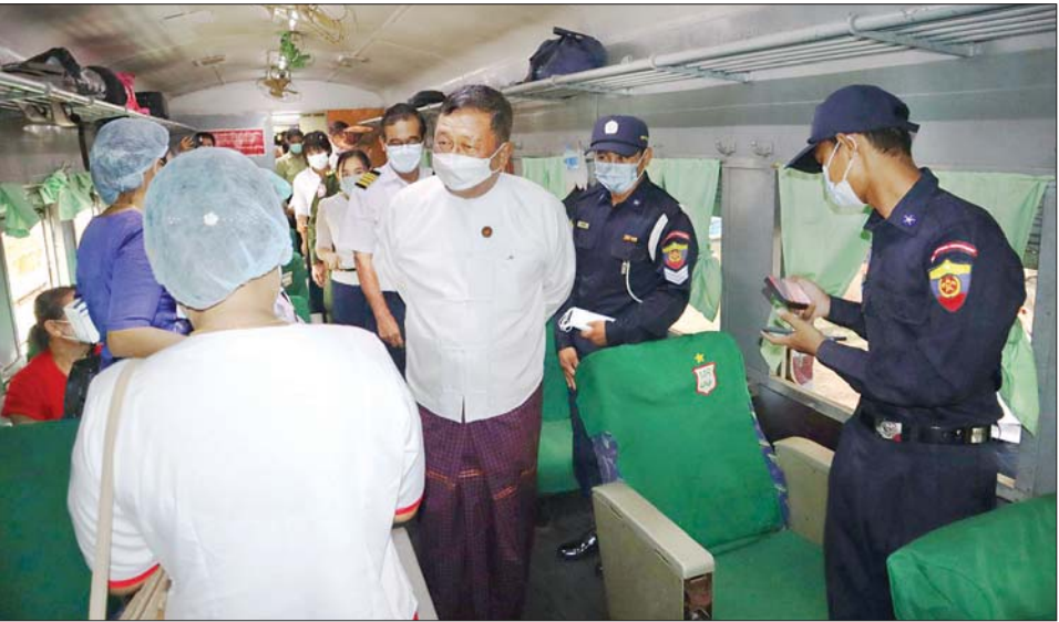
အလားတူ ပြည်နယ်ဝန်ကြီးချုပ်သည် လိုအပ်သည်များကို ပြည်သူ့ဆေးရုံကြီးတွင် ဆေးကုသမှု ကြောင်း သိရသည်။ ခံယူနေကြသည့် လူနာများကို အားပေးကြည့်ရှုပြီး သတင်းစဉ်

မွန်ပြည်နယ်ဝန်ကြီးချုပ် ဦးဇော်လင်းထွန်းနှင့် ပြည်နယ်ဝန်ကြီးများသည် ယနေ့ နံနက်ပိုင်းက မော်လမြိုင်မြို့ မြေနီကုန်းရပ်ကွက် မော်လမြိုင်ဘူတာကြီး၌ ခရီးသွားပြည်သူများအား ကိုဗစ်-၁၉ ရောဂါကာကွယ် ထိန်းချုပ် နိုင်ရေးအတွက် ဌာနဆိုင်ရာများ၊ အမျိုးသမီးရေးရာ၊ မိခင်နှင့်ကလေးစောင့်ရှောက်ရေးအဖွဲ့များနှင့် လူမှုအဖွဲ့ အစည်းများ ပူးပေါင်း၍ အသိပညာပေးဆောင်ရွက်နေမှု၊ Mask များ အခမဲ့ဝေငှခြင်းအစီအစဉ် Mask Campaign ပြုလုပ်ဆောင်ရွက်နေမှုကို ကြည့်ရှုအားပေးသည်။ (ယာဝုံ)