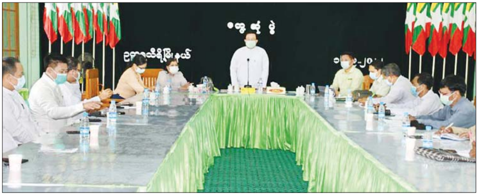
နေပြည်တော် ကောင်စီအဖွဲ့ဝင် တို့က ပေါင်းစပ်ညှိနှိုင်းဆောင်ရွက် ပေးခဲ့သည်။