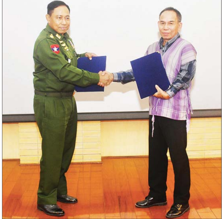
ငြိမ်းချမ်းရေးဆွေးနွေးရေးအဖွဲ့ခေါင်းဆောင် ဒုတိယဗိုလ်ချုပ်ကြီး ရာပြည့်နှင့် ဒီမိုကရေစီအကျိုးပြု ကရင်တပ်မတော် (DKBA) စစ်ဦးစီးချုပ်အဆင့်ရှိ စောစတီးတို့ သဘောတူညီချက်များကို အတည်ပြုလက်မှတ်ရေးထိုး လဲလှယ်ကြသည်။

ယင်းနောက် တက်ရောက်လာကြသည့် တိုင်းရင်းသားလက်နက်ကိုင်အဖွဲ့များ ကိုယ်စား ဒီမိုကရေစီအကျိုးပြု ကရင်တပ်မတော် (DKBA) စစ်ဦးစီးချုပ်အဆင့်ရှိ စောစတီးနှင့် ငြိမ်းချမ်းရေးဆွေးနွေးရေးအဖွဲ့ခေါင်းဆောင် ဒုတိယဗိုလ်ချုပ်ကြီး ရာပြည့်တို့က နိဂုံးချုပ်အမှာစကားများ ပြောကြားပြီး ပြန်ကြားရေးဝန်ကြီးဌာနမှ ထုတ်ဝေသည့် နိုင်ငံတော်စီမံအုပ်ချုပ်ရေးကောင်စီ၏ နိုင်ငံအကျိုးသယံပိုးဆောင်ရွက်ချက် မှတ်တမ်းစာအုပ်နှင့် စာအုပ်စာစောင်များ၊ MRTV DTH Receiver၊ နှစ်ပေစလောင်းနှင့် လက်ဆောင်ပစ္စည်းများအား ပေးအပ်ခဲ့ကြောင်း သိရှိရသည်။ သတင်းစဉ်