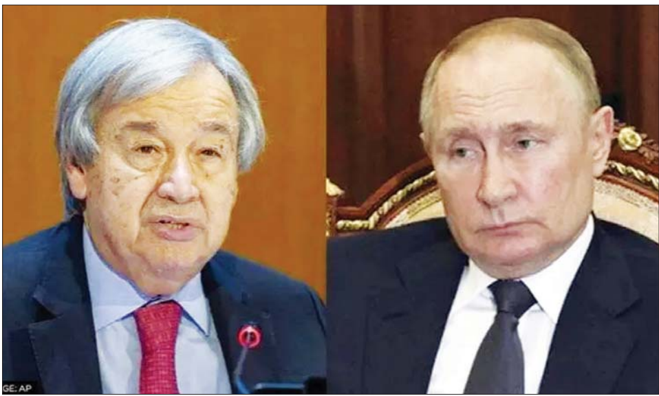
ကုလသမဂ္ဂအတွင်းရေးမှူးချုပ် ဂူတာရက်စ်နှင့် ရုရှားသမ္မတ ဗလာဒီမာပူတင်။

မော်စကို စက်တင်ဘာ ၁၅ ကုလသမဂ္ဂအထွေထွေ အတွင်းရေးမှူးချုပ် အန်တိုနီယို ဂူတာရက်စ်သည် ရုရှားသမ္မတ ဗလာဒီမာပူတင်နှင့် စက်တင်ဘာ ၁၄ ရက်တွင် ဖုန်းဖြင့် ဆွေးနွေးခဲ့ကြောင်း၊ ရုရှားနိုင်ငံ အစားအစာနှင့် ဓာတ်မြေဩဇာတင်ပို့မှုများနှင့် ပတ်သက်သည့် အတားအဆီးများကို ဆွေးနွေးခဲ့ကြောင်း ကုလသမဂ္ဂအတွင်းရေးမှူးချုပ်က ပြောကြားသည်။