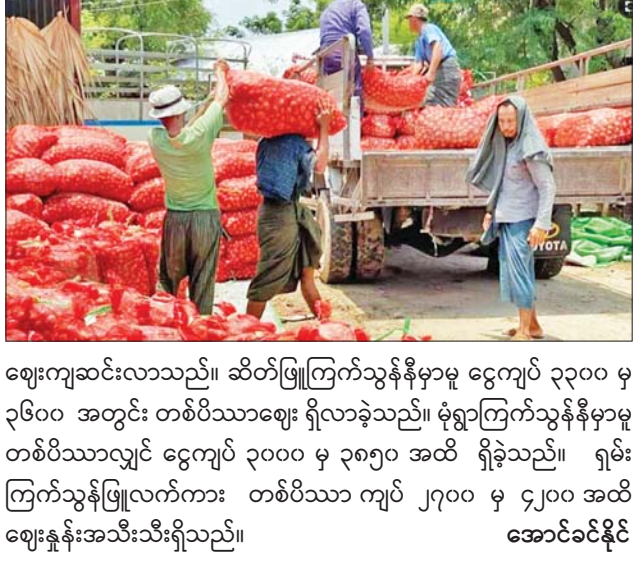
ဈေးကျဆင်းလာသည်။ ဆိတ်ဖြူကြက်သွန်နီမှာမူ ငွေကျပ် ၃၃၀၀ မှ ၃၆၀၀ အတွင်း တစ်ပိဿာဈေး ရှိလာခဲ့သည်။ မုံရွာကြက်သွန်နီမှာမူ တစ်ပိဿာလျှင် ငွေကျပ် ၃၀၀၀ မှ ၃၈၅၀ အထိ ရှိခဲ့သည်။ ရှမ်း ကြက်သွန်ဖြူလက်ကား တစ်ပိဿာ ကျပ် ၂၇၀၀ မှ ၄၂၀၀ အထိ ဈေးနှုန်းအသီးသီးရှိသည်။ အောင်ခင်နိုင်

SQ/RC တစ်တန် ကျပ် ၂၉၅၀၀၀၊ ပဲစင်းငုံနီ Red/RC တစ်တန် ကျပ် ၂၀၇၅၀၀။ ကုလားပဲခြမ်း တစ်ပိဿာ ကျပ် ၄၄၀၀-၄၇၀၀ နှုန်း ရှိသည်။ စားအုန်းဆီ ယခုအပတ်တွင် ရည်ညွှန်းဈေး တစ်ပိဿာလျှင် ငွေကျပ် ၄၉၀ နှုန်း ဈေး ကျဆင်းလာခဲ့သည်။ စက်တင်ဘာ ၁၂ ရက်မှ ၁၈ ရက်အထိ ရန်ကုန်အထိုင် လက်ကားရည်ညွှန်းဈေးမှာ စားအုန်းဆီ တစ်ပိဿာ ကျပ် ၄၇၃၀ သာ ရှိသည်။ ရည်ညွှန်းဈေးကျသကဲ့သို့ ရန်ကုန်စားအုန်းဆီ ပြင်ပဈေးကွက်တွင်လည်း အလှယ်လက်ကားလက်ငင်းပီပီ ဈေး တစ်ပိဿာ ကျပ် ၇၆၀၀ - ၇၈၀၀ နှုန်းဖြင့် စက်တင်ဘာ ၁၄ ရက်တွင် ရောင်းချနေကြသည်။ ကြက်သွန်နီ/ကြက်သွန်ဖြူ ဘုရင့်နောင်ဈေးကွက်သို့ တရုတ်ကြက်သွန်နီ တစ်ပိဿာ ကျပ် ၂၇၅၀ နှုန်းဖြင့် ဝင်ရောက်လာပြီး တစ်ပတ်အတွင်း ကျပ် ၂၅၀၀ အထိ