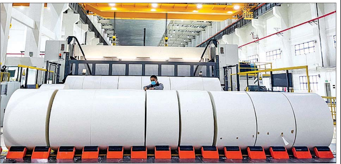
တရုတ်နိုင်ငံ ကွမ်ရှီးပြည်နယ်မှ Asia Pulp & Paper စက္ကူစက်ရုံ။

အင်ဒိုနီးရှားကုမ္ပဏီသည် တရုတ်၊ လာအိုနှင့် ကမ္ဘောဒီးယားနိုင်ငံတို့ရှိ သစ်တောရေးရာများကို စီမံခန့်ခွဲရန် အတွက် ဇန်နဝါရီလတွင် ရုံးခွဲတစ်ခုကို တည်ထောင်ခဲ့ပြီး တရုတ်နှင့် ဒေသတွင်း ဘက်စုံစီးပွားရေး ပူးပေါင်းဆောင်ရွက်မှု (RCEP) နိုင်ငံများကြား စီးပွားရေး ပူးပေါင်းဆောင်ရွက်မှု အလားအလာကို စောင့်ကြည့်နေသောကြောင့် ကုမ္ပဏီ အနေဖြင့် စက်မှုလုပ်ငန်းကွင်းဆက် များ တိုးချဲ့ရန်ကြိုးပမ်းခဲ့သည်။ RCEP အကောင်အထည်ဖော်မှုသည် အာဆီယံ နိုင်ငံများနှင့် တရုတ်စီးပွားရေးလုပ်ငန်း များကို ပိုမိုပွင့်လင်းမြင်သာသော