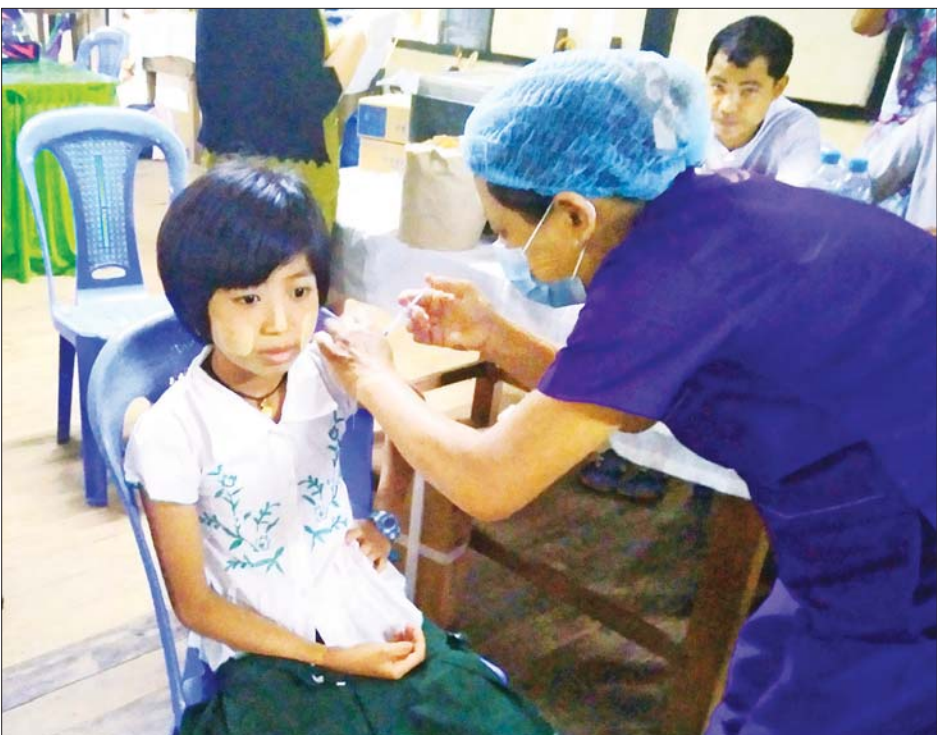
ဂြိုဟ်နယ်၌ ကျောင်းသား ကျောင်းသူများအား ကိုဗစ် -၁၉ ရောဂါ ကာကွယ်ဆေးများ ဆက်လက်ထိုးနှံပေးစဉ်။

စက်တင်ဘာလ ၁၃ ရက်နေ့ ၂၂ နာရီထုတ်ပြန်တဲ့ ကျန်းမာရေးဝန်ကြီးဌာနရဲ့ သတင်းအချက်အလက်တွေအရ ၂၄ နာရီအတွင်း ကိုဗစ်-၁၉ ရောဂါ ဓာတ်ခွဲအတည်ပြု လူနာသစ် ၂၉၉ ဦး တွေရှိခဲ့ပြီး အဲဒီနေ့အတွက် ရောဂါပိုးတွေ့ရှိမှုရာခိုင်နှုန်းမှာ ၂ ဒသမ ၆၇ ရာခိုင်နှုန်းလို့ သိရပါတယ်။ ဒါ့အပြင် စက်တင်ဘာ ၁၂ ရက်က အတည်ပြုလူနာသစ် ၂၀၄ ဦး (၁ ဒသမ ၈ ရာခိုင်နှုန်း)၊ စက်တင်ဘာ ၁၁ ရက်က အတည်ပြုလူနာသစ် ၁၈၉ ဦး (၂ ဒသမ ၀၂ ရာခိုင်နှုန်း)၊ စက်တင်ဘာ ၁၀ ရက်က အတည်ပြုလူနာသစ် ၂၆၂ ဦး (၂ ဒသမ ၄၃ ရာခိုင်နှုန်း) စသည်ဖြင့် ပိုးတွေ့သူအရေအတွက် ပြန်လည်မြင့်တက်လာနေပါတယ်။