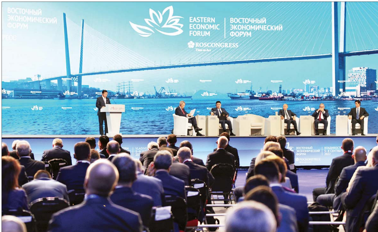
နိုင်ငံတော်စီမံအုပ်ချုပ်ရေးကောင်စီဥက္ကဋ္ဌ နိုင်ငံတော်ဝန်ကြီးချုပ် ဗိုလ်ချုပ်မှူးကြီး မင်းအောင်လှိုင် Eastern Economic Forum-2022 ၏ မျက်နှာစုံညီအစည်းအဝေး Plenary Session ၌ ဆွေးနွေးစဉ်။

မြန်မာနိုင်ငံ၏အရေးပါမှု “စားနပ်ရိက္ခာလုံခြုံရေး (Food Security) ကဏ္ဍတွင် မြန်မာနိုင်ငံ၏ အရေးပါမှုနှင့် ရင်းနှီးမြှုပ်နှံမှုအတွက် အခွင့်အလမ်းကောင်းများ” ဟူသော ခေါင်းစဉ်ဖြင့် နိုင်ငံတော်စီမံအုပ်ချုပ်ရေးကောင်စီဥက္ကဋ္ဌ နိုင်ငံတော်ဝန်ကြီးချုပ်က ဆွေးနွေးသည်။ ဆွေးနွေးသည့် ခေါင်းစဉ်တွင် အပိုင်း နှစ်ပိုင်းပါ၍ အိမ်မြန်မာနိုင်ငံမှ တိုင်းရင်းသား ညီအစ်ကိုမောင်နှမများ