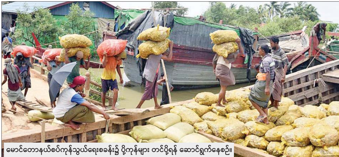
မောင်တောနယ်စပ်ကုန်သွယ်ရေးစခန်း၌ ပို့ကုန်များ တင်ပို့ရန် ဆောင်ရွက်နေစဉ်။