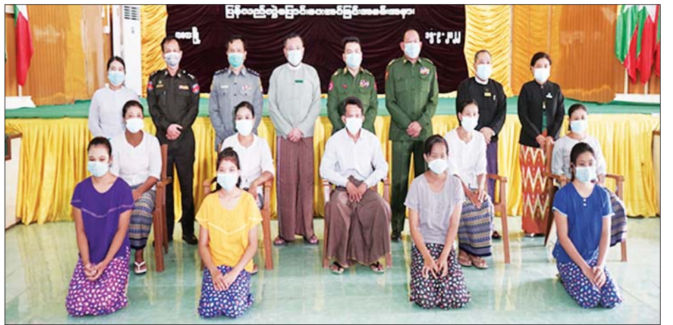
မည်ဖြစ်ကြောင်း နိုင်ငံတော်အစိုးရနှင့် ပြည်နယ်အသီးသီး၌ ဥပဒေဘောင်အတွင်း ပြန်လည်ဝင်ရောက်လျက် ရှိကြသဖြင့် အဖွဲ့ဝင်များက တိုင်းဒေသကြီး သက်ဆိုင်ရာ တာဝန်ရှိသူများက

အတွင်းမှ PDF အဖွဲ့ဝင် အမျိုးသမီး လေးဦးကို ဝန်ခံကတိလက်မှတ်ရေးထိုးစေကာထောက်ပံ့ပစ္စည်းများပေးအပ်ပြီး ၎င်းတို့၏ မိဘ အုပ်ထိန်းသူများထံသို့ လွှဲပြောင်းအပ်နှံပေးကြသည်။ ကြိုဆိုလက်ခံသွားမည့် PDF အပါအဝင် အဖွဲ့အစည်း အမျိုးမျိုးတို့အနေဖြင့် နိုင်ငံတော်၏ ရှေ့လုပ်ငန်းစဉ်များတွင် ပါဝင်ပူးပေါင်း ဆောင်ရွက်နိုင်ရေး သတ်မှတ်စည်းကမ်းချက်များနှင့် အညီ ဥပဒေဘောင်အတွင်းသို့ လက်နက်အပ်နှံပြီး ပြည်သူ့ဘဝသို့ ပြန်လည်ဝင်ရောက်ခြင်းပြုမည်ဆိုပါက ကြိုဆိုလက်ခံသွား