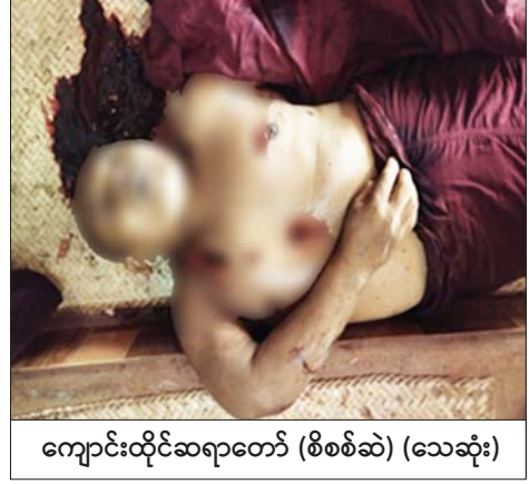
ကျောင်းထိုင်ဆရာတော် (စိစစ်ဆဲ) (သေဆုံး)

အဖွဲ့က စစ်ဆေးမှုများ ဆောင်ရွက်ခဲ့ရာ ဟုမ္မလင်းမြို့နယ်အတွင်း Yamaha FZ အမျိုးအစား လိုင်စင်မဲ့ဆိုင်ကယ်တစ်စီး ခန့်မှန်းတန်ဖိုးငွေကျပ် ၅၀၀,၀၀၀ ကိုလည်းကောင်း၊ ရွှေဘိုမြို့နယ်အတွင်း Kenbo 125 အမျိုးအစား လိုင်စင်မဲ့ဆိုင်ကယ်တစ်စီး ခန့်မှန်းတန်ဖိုးငွေကျပ် ၁၅၀,၀၀၀ ကိုလည်းကောင်း၊ စုစုပေါင်း ခန့်မှန်းတန်ဖိုးငွေကျပ် ၆၅၀,၀၀၀ ကို ဖမ်းဆီးရမိခဲ့ပြီး ပို့ကုန်သွင်းကုန် ဥပဒေနှင့်အညီ အရေးယူ ဆောင်ရွက်လျက်ရှိသည်။ ထို့အတူ မကွေးတိုင်းဒေသကြီး တရားမဝင်ကုန်သွယ်မှုတိုက်ဖျက်ရေးအထူးအဖွဲ့၏ စီမံခန့်ခွဲမှုဖြင့် ပူးပေါင်းစစ်ဆေးရေးအဖွဲ့က စစ်ဆေးမှုများ ဆောင်ရွက်ခဲ့ရာ မကွေးခရိုင် နတ်မောက်မြို့နယ်အတွင်း တရားမဝင် မီးသွေး ၃၇ ဒဿမ ၃၀၆၀ တန် (ခန့်မှန်းတန်ဖိုးငွေကျပ် ၃၅၀,၀၀၀) နှင့် အဆိုပါ မီးသွေးအိတ်များ တင်ဆောင်လာသည့် မော်တော်ယာဉ်တစ်စီး (ခန့်မှန်းတန်ဖိုးငွေကျပ် ၃၅,၀၀၀,၀၀၀) စုစုပေါင်း ခန့်မှန်းတန်ဖိုးငွေကျပ် ၃၅,၃၅၀,၀၀၀ ကို ဖမ်းဆီးရမိခဲ့ပြီး သစ်တောဥပဒေနှင့်အညီ အရေးယူ ဆောင်ရွက်လျက်ရှိသည်။ ၎င်းအပြင် စက်တင်ဘာ ၁၅ ရက်တွင် ကရင်ပြည်နယ် တရားမဝင် ကုန်သွယ်မှုတိုက်ဖျက်ရေးအထူးအဖွဲ့၏ စီမံခန့်ခွဲမှုဖြင့် ကော့ကရိတ် (တံတားကျိုး) စုပေါင်းစစ်ဆေးရေးစခန်း၌ တာဝန်ကျပူးပေါင်းအဖွဲ့က စစ်ဆေးမှုများ ဆောင်ရွက်ခဲ့ရာ ကုန်တင်ယာဉ် တစ်စီးပေါ်၌ သွင်းကုန်ကြေညာလွှာ (ID) တွင် ကြေညာထားခြင်းမရှိသည့် အဝတ်အထည်များ (ခန့်မှန်းတန်ဖိုးငွေကျပ် ၁၅၆၀,၀၀၀)ကို ဖမ်းဆီးရမိခဲ့ပြီး အကောက်ခွန် လုပ်ထုံးလုပ်နည်းနှင့်အညီ အရေးယူဆောင်ရွက်လျက်ရှိသည်။ သို့ဖြစ်ပါ၍ စက်တင်ဘာ ၁၂ ရက်၊ ၁၃ ရက်၊ ၁၄ ရက်နှင့် ၁၅ ရက်နေ့တို့တွင် ဖမ်းဆီးရမိမှု စုစုပေါင်းမှာ အမှုတွဲ (၁၈) မှု (ခန့်မှန်းတန်ဖိုးငွေကျပ် ၁၅၁,၃၅၈,၉၃၈) ဖြစ်ကြောင်း တရားမဝင်ကုန်သွယ်မှုတိုက်ဖျက်ရေး ဦးဆောင်ကော်မတီမှ သိရသည်။ သတင်းစဉ်