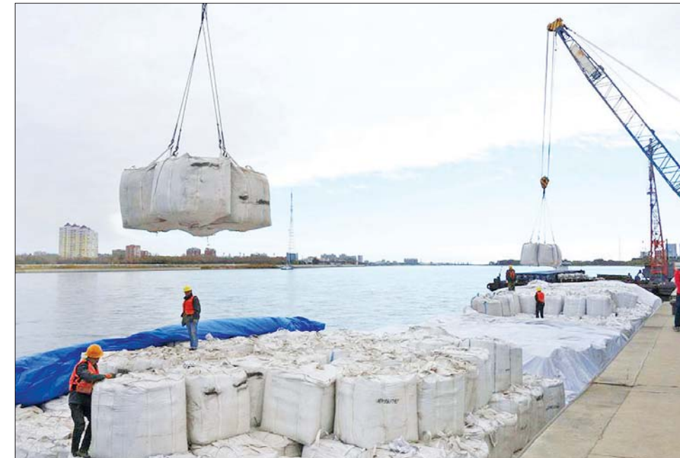
ရုရှားနိုင်ငံမှ တင်သွင်းလာသော ပဲပိစပ်အိတ်များကို တရုတ်နိုင်ငံ ဟေလုံကျန်ဆိပ်ကမ်း၌ သယ်ချနေစဉ်။

တရုတ်-ရုရှား နှစ်နိုင်ငံ အကြား ကုန်သွယ်မှုသည် အရှိန်