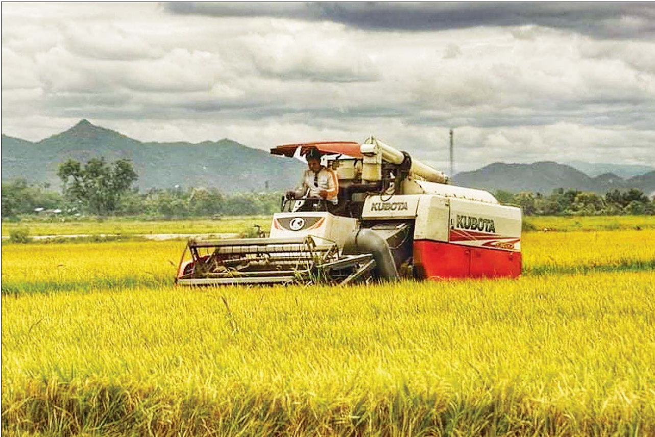
ခေတ်မီကောက်ရိတ်စက် အသုံးပြု၍ ရိတ်သိမ်းနေမှုကို တွေ့ရစဉ်။

အိုဇုန်းလွှာကာကွယ်ထိန်းသိမ်းမှုဖြင့် ရာသီဥတုပြောင်းလဲမှုကို ကာကွယ်စို့ ဆောင်းပါး စာ - ၁၈