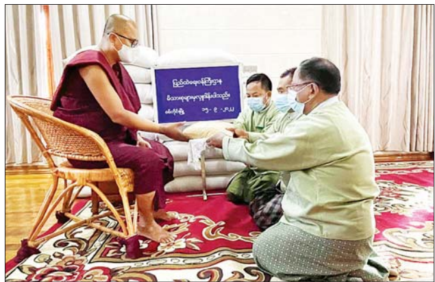
ကျောင်းတိုက်၊ ရန်ကုန်တိုင်းဒေသကြီး သမန်းကျွန်းမြို့နယ်ရှိ စွန်းလွန်းဂူ ဝိပဿနာကျောင်းတိုက်နှင့် ရှမ်းပြည်နယ် တောင်ကြီးမြို့နယ်ရှိ အောင်မေတ္တာပရိယတ္တိစာသင်တိုက်တို့သို့ ဆန်ကြာဆံများကို လည်းကောင်း ဆရာတော်၊ သံဃာတော်များအတွက် တာဝန်ရှိသူများက သွားရောက်ဆက်ကပ် လှူဒါန်းခဲ့ကြကြောင်း သိရသည်။ သတင်းစဉ်

နေပြည်တော် စက်တင်ဘာ ၁၅ ပြည်ထဲရေးဝန်ကြီးဌာန၊ တပ်ဖွဲ့ဝင်/ဝန်ထမ်းအရာထမ်း၊ အမှုထမ်းမိသားစုများက မြို့နယ်အသီးသီးရှိ ဘုန်းတော်ကြီးကျောင်းများသို့ ဆွမ်းဆန်တော်နှင့် ဆန်ကြာဆံများ ဆက်ကပ်လှူဒါန်းလျက်ရှိသည်။ ထိုသို့လှူဒါန်းလျက်ရှိရာ ယနေ့တွင် နေပြည်တော်ကောင်စီနယ်မြေဒဂုံဏာသီရိမြို့နယ်ရှိ သဒ္ဓမ္မဝေပုလ္လပရိယတ္တိစာသင်တိုက်၊ စစ်ကိုင်းတိုင်းဒေသကြီး စစ်ကိုင်းမြို့နယ်ရှိ မဟာစကြာစာသင်တိုက်၊ မွန်ပြည်နယ် မော်လမြိုင်မြို့နယ်ရှိ ဆန်တန်းကျောင်းသစ်ကျောင်းတိုက်၊ ရခိုင်ပြည်နယ် စစ်တွေမြို့နယ်ရှိ ကျားရုပ်ပရိယတ္တိစာသင်တိုက်၊ ရန်ကုန်တိုင်းဒေသကြီး ဒဂုံမြို့သစ်အရှေ့ပိုင်းမြို့နယ်ရှိ တိပိဋကမဟာဂန္ထဝင်နိကာယ်ကျောင်းတိုက်၊ မင်္ဂလာတောင်ညွန့်မြို့နယ်ရှိ မဟာဝိဇယာရာမကျောင်းတိုက်၊ ရန်ကင်းမြို့နယ်ရှိ အောင်ချမ်းသာပရိယတ္တိစာသင်တိုက်တို့သို့ ဆွမ်းဆန်တော်များကိုလည်းကောင်း၊ ကချင်ပြည်နယ် မြစ်ကြီးနားမြို့နယ်ရှိ မဟာဂန္ဓာရုံတိုက်သစ်ကျောင်းတိုက်၊ မကွေးတိုင်းဒေသကြီး မကွေးမြို့နယ်ရှိ အောင်မြေရတနာစာသင်တိုက်၊ မန္တလေးတိုင်းဒေသကြီး မဟာအောင်မြေမြို့နယ်ရှိ ကင်းဝန်မင်းကြီးကျောင်းတိုက်၊ အောင်မြေသာစံမြို့နယ်ရှိ ကုသိုလ်တော်ရိပ်သာ