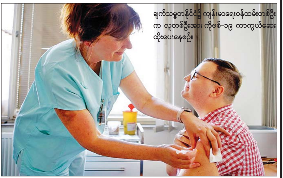
ချက်သမ္မတနိုင်ငံ၌ ကျန်းမာရေးဝန်ထမ်းတစ်ဦးက လူတစ်ဦးအား ကိုဗစ်-၁၉ ကာကွယ်ဆေးထိုးပေးနေစဉ်။

ကမ္ဘာ့ကျန်းမာရေးအဖွဲ့ကြီး၏ အဆိုအရ စက်တင်ဘာ ၅ ရက်မှ ၁၁ ရက်ကြားတွင် ကမ္ဘာတစ်ဝန်း ကိုရိုနှာပိုင်းရပ်စ်ကူးစက်ဖြစ်ပွားမှု အရေအတွက်သည် ယခင်သီတင်းပတ်ထက် ၂၈ ရာခိုင်နှုန်းကျဆင်းသွားပြီး ၃ ဒသမ ၁ သန်းကျော်ရှိသည်။ အပတ်စဉ် သေဆုံးမှုအရေအတွက်သည်လည်း ၂၂ ရာခိုင်နှုန်းကျဆင်းခဲ့ပြီး ၁၁၀၀၀ အောက်သာ ရှိခဲ့သည်။ တက်ဒရော့စ်အနေဖြင့် ကပ်ရောဂါတုံ့ပြန်မှုကို မာရသွန်ပြိုင်ပွဲနှင့် တင်စားခဲ့ပြီး ယခုအချိန်သည် ပိုပြီးအားသွန်ခွန်စိုက်ပြေးရမည့် အချိန်ဖြစ်ကြောင်း နောက်ဆုံးပန်းတိုင်ကိုကျော်ဖြတ်ပြီး မိမိစိုက်ပျိုးခဲ့သည့် ရလဒ်များကို မိမိပြန်လည်ရိတ်သိမ်းရမည်ဖြစ်ကြောင်း ပြောကြားခဲ့သည်။ ဆင်ဟွာ