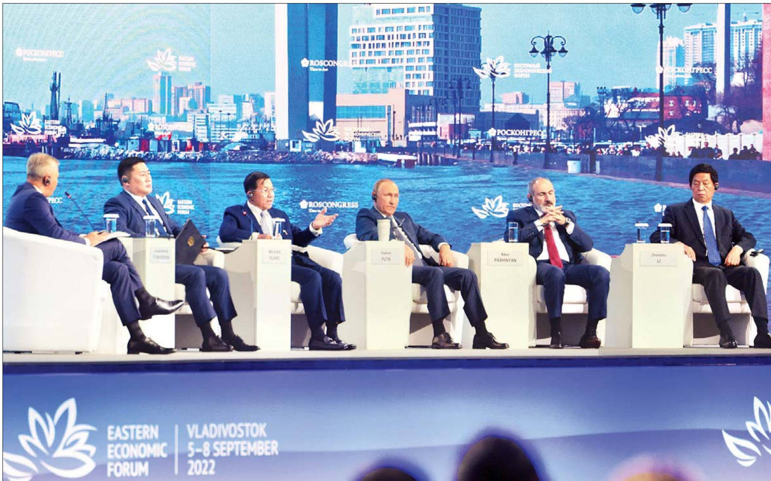
နိုင်ငံတော်စီမံအုပ်ချုပ်ရေးကောင်စီဥက္ကဋ္ဌ နိုင်ငံတော်ဝန်ကြီးချုပ်၏ ဆွေးနွေးမှုနှင့်ပတ်သက်၍ အခမ်းအနားမှူးက သိရှိလိုသည်များကို ပြန်လည်မေးမြန်းဆွေးနွေးပြောကြားခဲ့ရာ နိုင်ငံတော်စီမံအုပ်ချုပ်ရေးကောင်စီဥက္ကဋ္ဌ နိုင်ငံတော်ဝန်ကြီးချုပ် ဗိုလ်ချုပ်မှူးကြီး မင်းအောင်လှိုင်က ပြန်လည်ရှင်းလင်းဆွေးနွေးစဉ်။