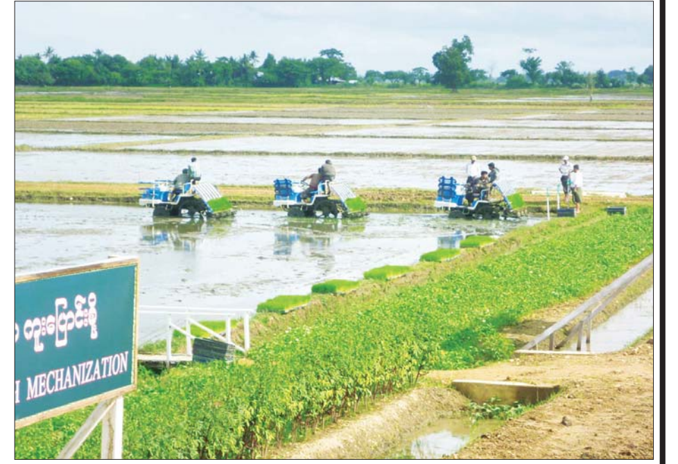
မြန်မာ့လယ်ယာကဏ္ဍတွင် ခေတ်မီစက်ကိရိယာများ အသုံးပြုလာမှုကို တွေ့ရစဉ်။