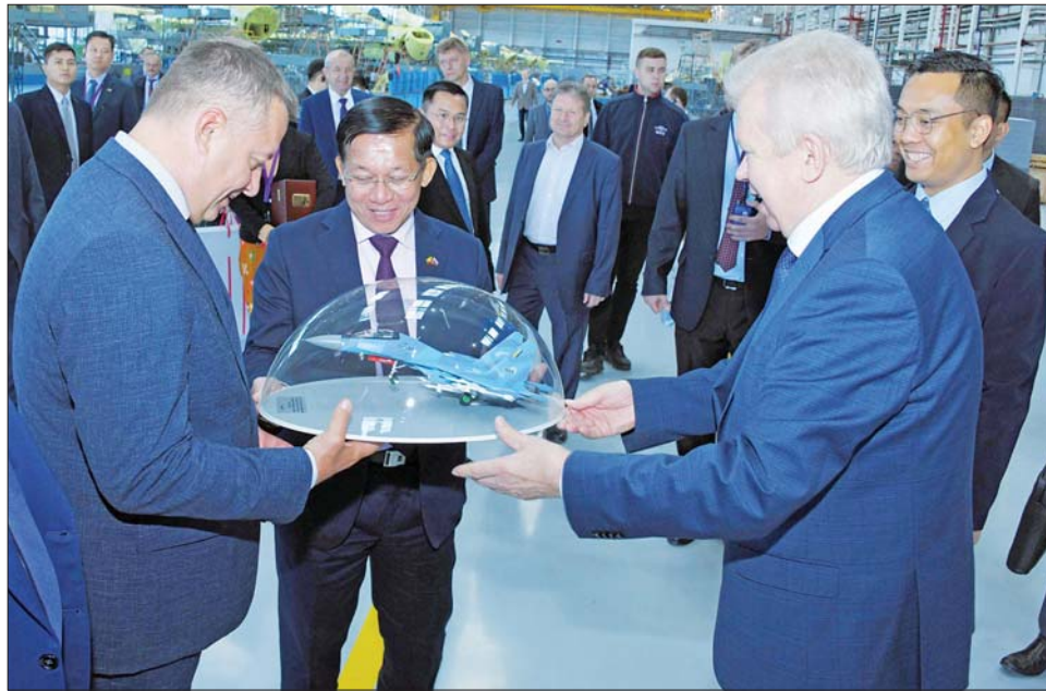
နိုင်ငံတော်စီမံအုပ်ချုပ်ရေးကောင်စီဥက္ကဋ္ဌ နိုင်ငံတော်ဝန်ကြီးချုပ် ဗိုလ်ချုပ်မှူးကြီး မင်းအောင်လှိုင်နှင့် Irkutsk Aviation Plant-Irkutsk Corporation Branch မှ အထွေထွေညွှန်ကြားရေးမှူးချုပ်တို့ အမှတ်တရ လက်ဆောင်ပစ္စည်းများ အပြန်အလှန်ပေးအပ်စဉ်။

အလိုက် sector များခွဲကာ Robotic system များ၊ Automatic Machine များဖြင့် တပ်ဆင်နေမှုများ၊ ထိုမှတစ်ဆင့် လေယာဉ်ကိုယ်ထည်ပိုင်း၊ တောင်ပံပိုင်း၊ အင်ဂျင်ပိုင်းများကို အဆင့်ဆင့်တပ်ဆင် တွဲဆက်နေမှုများ၊ စက်ခေါင်းခန်းအတွင်း ထိန်းချုပ်မှု System များ၊ အတွင်းပိုင်း အပြင်အဆင်များကို အဆင့်မြင့်တင် ဆောင်ရွက်ထားရှိမှုများ၊ လေယာဉ်ထုတ်လုပ်နေမှု အခြေအနေများနှင့် လေယာဉ်၏ စွမ်းဆောင်ရည်ပိုင်းနှင့် ကြံ့ခိုင်ရေးပိုင်းတို့ကို စမ်းသပ် စစ်ဆေးလျက်ရှိသည့် အခြေအနေများ၊ မြန်မာ့တပ်မတော်အတွက် ထုတ်လုပ်လျက်ရှိသည့် Su-30 တိုက်ခိုက်ရေးလေယာဉ်များ ထုတ်လုပ်တပ်ဆင်နေမှု ထုတ်လုပ်ပြီးလေယာဉ်များအား လေ့ကျင့်စမ်းသပ်နေမှု အခြေအနေများနှင့်ပတ်သက်၍ ရှင်းလင်းတင်ပြသည်။ ရှင်းလင်းတင်ပြမှုများနှင့် ပတ်သက်၍ နိုင်ငံတော်စီမံအုပ်ချုပ်ရေးကောင်စီဥက္ကဋ္ဌ နိုင်ငံတော်ဝန်ကြီးချုပ်က သိရှိလိုသည်များ ပြန်လည်မေးမြန်း