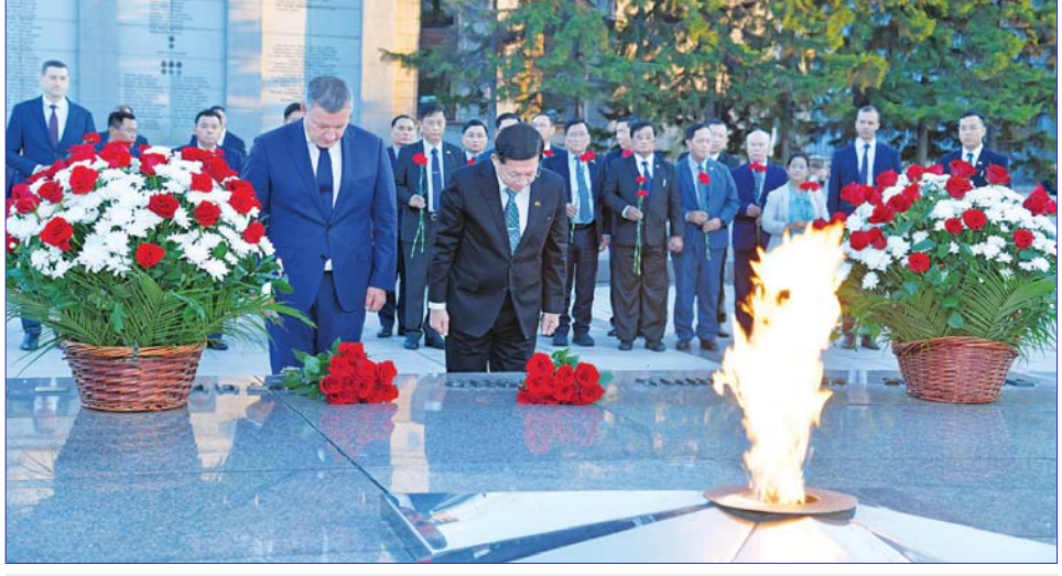
နိုင်ငံတော်စီမံအုပ်ချုပ်ရေးကောင်စီဥက္ကဋ္ဌ နိုင်ငံတော်ဝန်ကြီးချုပ် ဗိုလ်ချုပ်မှူးကြီး မင်းအောင်လှိုင် ဒုတိယ ကမ္ဘာစစ်အတွင်း အသက်စွန့်ခဲ့ကြရသည့် ဆိုဗီယက်ပြည်ထောင်စုမှ စစ်သည်တော်များအား ဂုဏ်ပြု သောအားဖြင့် ဂုဏ်ပြုပန်းခွေချ အလေးပြုစဉ်။