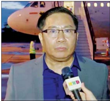
ဦးမိုးဟိန်း

ဗိုလ်ချုပ်ဇော်မင်းထွန်း ရုရှားဖက်ဒရေးရှင်းနိုင်ငံ ခရီးစဉ်ကို တစ်ပတ်ကြာ သွားရောက်ခဲ့ပါတယ်။ အဓိကရည်ရွယ်ချက်ကတော့ အရှေ့ဖျား စီးပွားရေးဖိုရမ်ကို သွားရောက်ပြီး တက်ရောက်တာဖြစ်ပါတယ်။ နိုင်ငံတော် စီမံအုပ်ချုပ်ရေးကောင်စီ ဥက္ကဋ္ဌ နိုင်ငံတော် ဝန်ကြီးချုပ် ဗိုလ်ချုပ်မှူးကြီး မင်းအောင်လှိုင်အနေနဲ့ ခရီးစဉ် စကားတည်းက မဟာဗျူဟာအရေရာ၊ နည်းဗျူဟာအရပါ အများကြီးပြင်ဆင် ခဲ့ပါတယ်။ ရုရှား-မြန်မာ နှစ်နိုင်ငံ ဆက်ဆံရေးကို တိုးမြှင့်ဆောင်ရွက်ဖို့၊ မြန်မာနိုင်ငံရဲ့ အမျိုးသားအကျိုးစီးပွားကို တိုးမြှင့်ဆောင်ရွက်ဖို့အတွက် များစွာ ကြိုးပမ်းခဲ့ပါတယ်။ ခရီးစဉ်မှာ ရုရှား ဖက်ဒရေးရှင်းနိုင်ငံ သမ္မတကြီးနဲ့တွေ့ဆုံ ခဲ့တဲ့အပြင် ရုရှားဖက်ဒရေးရှင်းနိုင်ငံရဲ့ ပြည်နယ်နှစ်ခုကို သွားရောက်လည်ပတ် ခဲ့ရခဲ့တယ်။ မြန်မာနိုင်ငံရဲ့ အနာဂတ် အတွက် အရေးပါတဲ့ လုပ်ငန်းတွေ လုပ်ဆောင်ခဲ့ပါတယ်။ မြန်မာနိုင်ငံရဲ့ အနာဂတ်အတွက်အရေးပါတဲ့ အကျိုးရှိ စွမ်းအင်ကို ငြိမ်းချမ်းစွာအသုံးပြုနိုင်ရေး အတွက် လုပ်ဆောင်နိုင်ခဲ့ပါတယ်။ အာကာသနည်းပညာနဲ့ ပတ်သက်ပြီး လည်း လုပ်ဆောင်နိုင်ခဲ့ပါတယ်။ ရုရှား- မြန်မာ နှစ်နိုင်ငံချစ်ကြည်ရေးကို ပိုမို တိုးမြှင့်နိုင်ဖို့ ကုန်သွယ်ရေး၊ ခရီးသွားလာ ရေး၊ ကျန်းမာရေး၊ ပညာရေး၊ လူမှုရေး၊ ဒီကဏ္ဍတွေအားလုံးကို တိုးမြှင့်နိုင်ဖို့ လုပ်ဆောင်နိုင်ခဲ့ပါတယ်။ အကျဉ်းချုပ် ပြောရရင် ဒီခရီးစဉ်က အောင်မြင်တဲ့ ခရီးစဉ်တစ်ခုဖြစ်ပါတယ်။ လူတစ်ယောက် ဖြစ်စေ၊ ဘဝတစ်ခုဖြစ်စေ၊ နိုင်ငံတစ်ခု ဖြစ်စေ၊ အောင်မြင်ဖို့အတွက် ကြိုးစား အားထုတ်မှုမရှိဘဲ မလုံလောက်ပါဘူး။