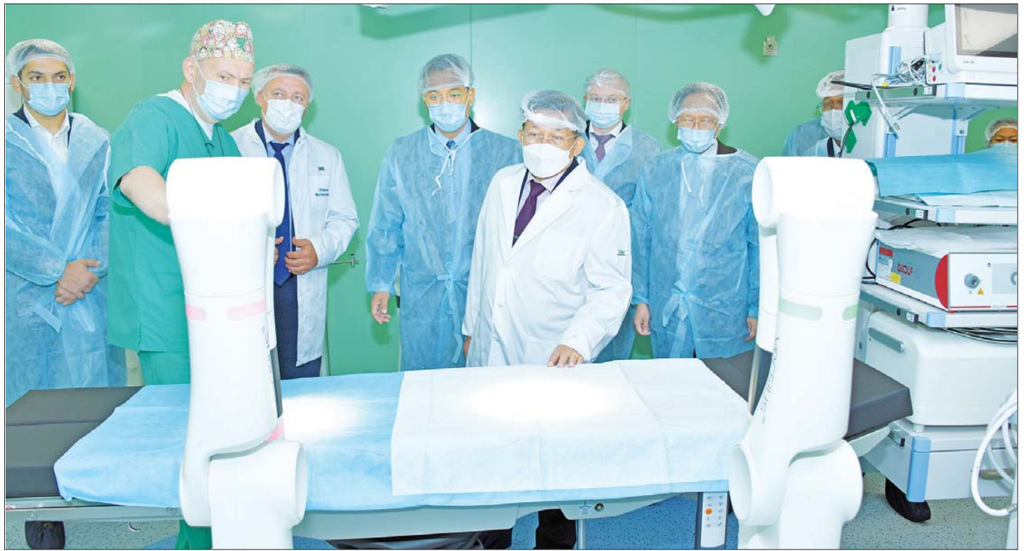
နိုင်ငံတော်စီမံအုပ်ချုပ်ရေးကောင်စီဥက္ကဋ္ဌ နိုင်ငံတော်ဝန်ကြီးချုပ် ဗိုလ်ချုပ်မှူးကြီး မင်းအောင်လှိုင် Irkutsk Regional Children's Clinical Hospital အတွင်း ကြည့်ရှုလေ့လာစဉ်။

ဆက်လက်ပြီး နိုင်ငံတော်စီမံအုပ်ချုပ်ရေး ကောင်စီဥက္ကဋ္ဌ နိုင်ငံတော်ဝန်ကြီးချုပ်နှင့် အဖွဲ့ဝင်များ သည် အမှတ်(၁၄)အခြေခံပညာအလယ်တန်းကျောင်း