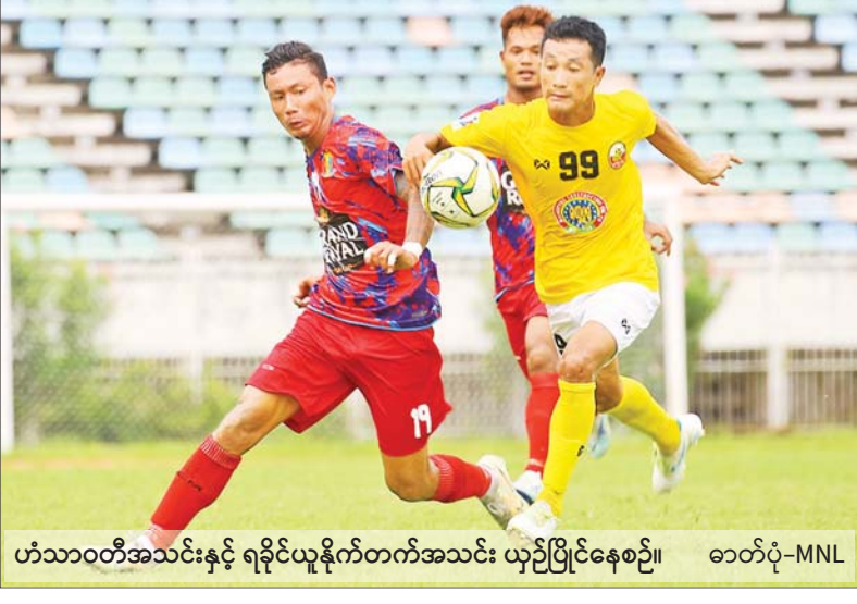
ဟံသာဝတီအသင်းနှင့် ရခိုင်ယူနိုက်တက်အသင်း ယှဉ်ပြိုင်နေစဉ်။