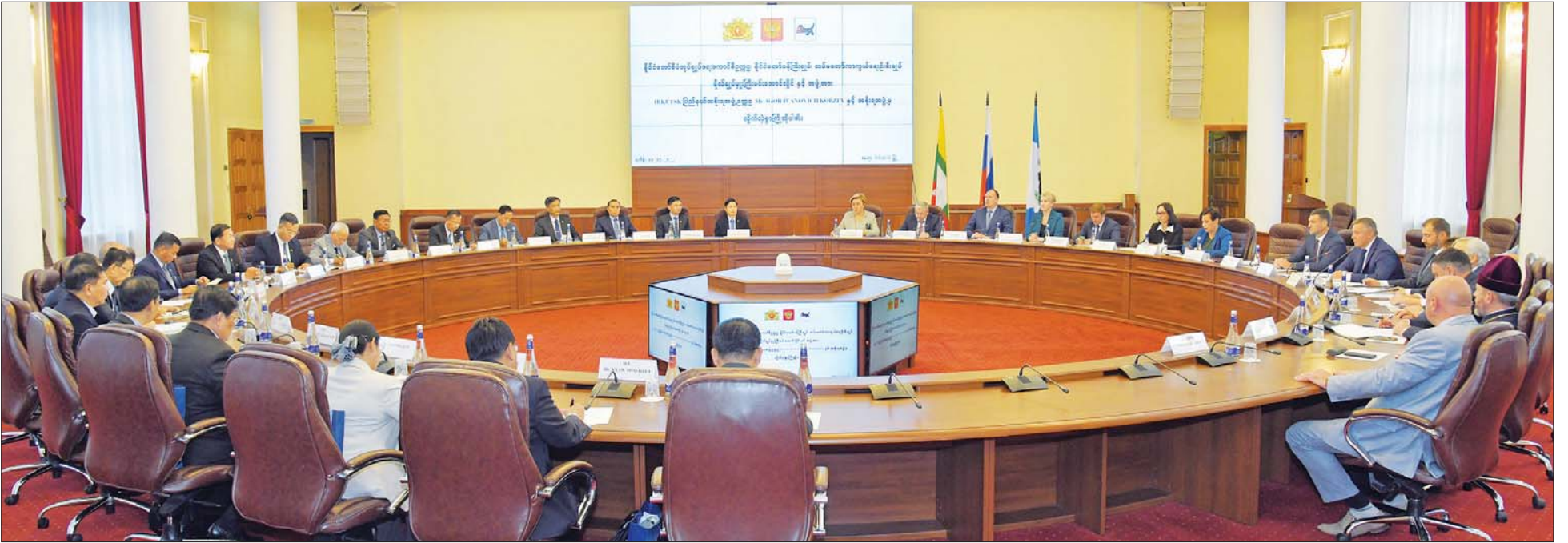
နိုင်ငံတော်စီမံအုပ်ချုပ်ရေးကောင်စီဥက္ကဋ္ဌ နိုင်ငံတော်ဝန်ကြီးချုပ် ဗိုလ်ချုပ်မှူးကြီး မင်းအောင်လှိုင် ရှာဖွေဖက်ဒရေးရှင်းနိုင်ငံ၊ Irkutsk ပြည်နယ်အစိုးရအဖွဲ့ အကြီးအကဲ Mr. Igor Ivanovich Kobzev နှင့် Irkutsk ပြည်နယ်အစိုးရအဖွဲ့ရုံးတွင် တွေ့ဆုံဆွေးနွေးစဉ်။