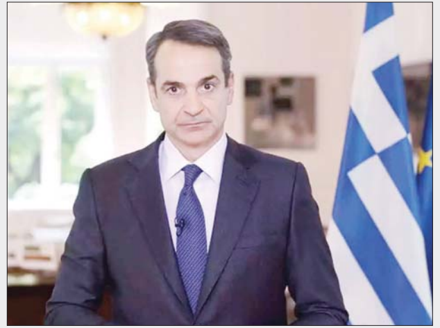
ဂရိဝန်ကြီးချုပ် ကီရီယာ ကော့ မက်စီတာကကတိက။