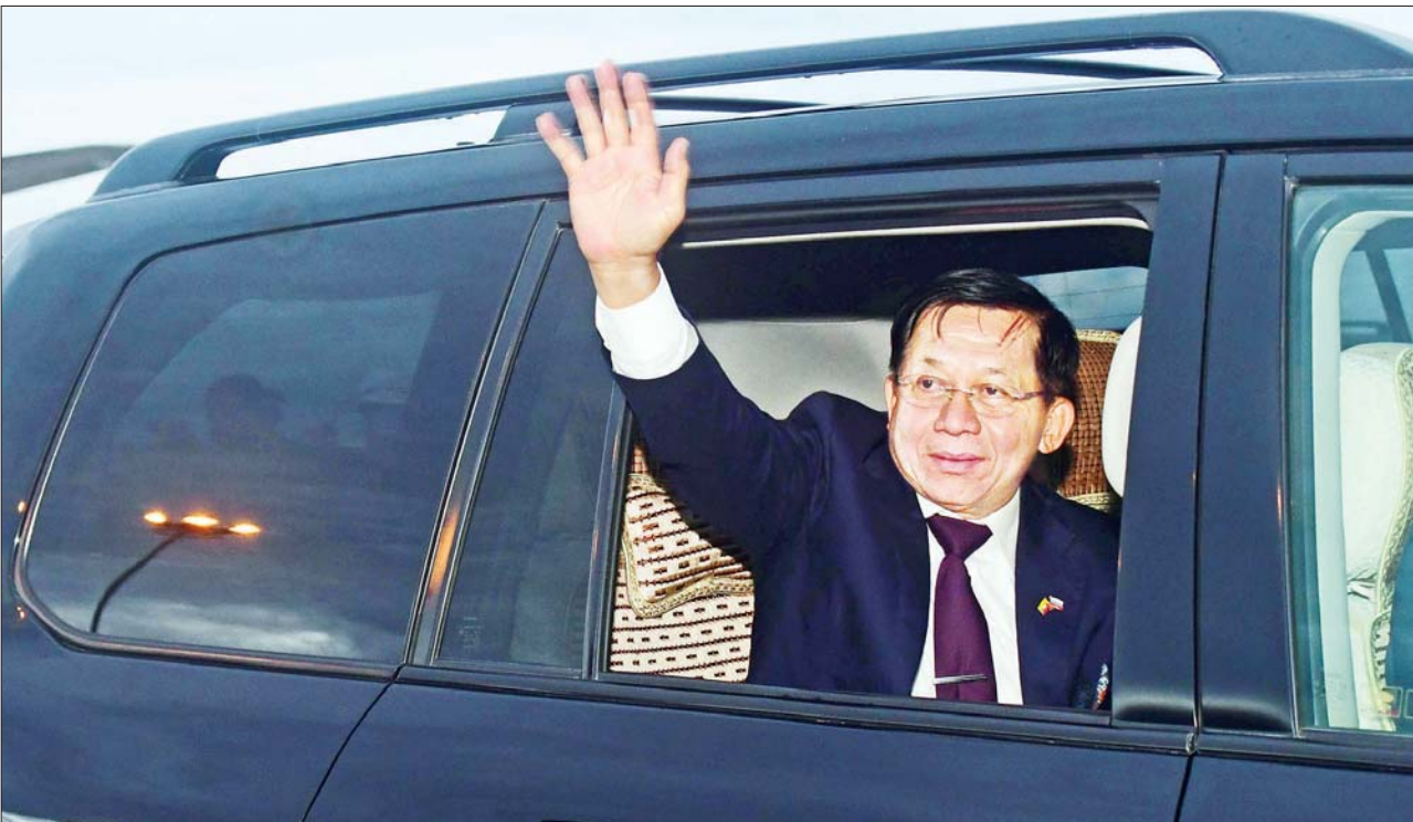
နေပြည်တော် စက်တင်ဘာ ၁၁

ဦးဆောင်သည့် ကိုယ်စားလှယ်အဖွဲ့အား ပြည်သူလူထုများက သောင်းသောင်းဖြဖြကြိုဆိုနှုတ်ဆက်