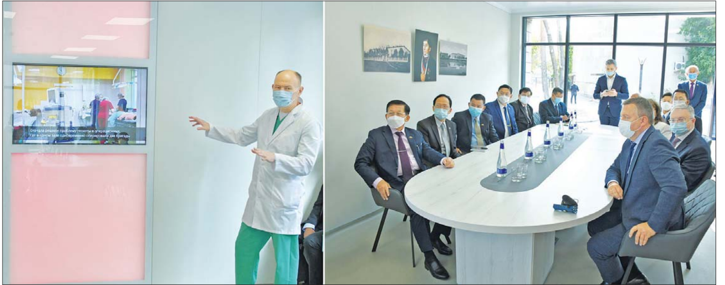
နိုင်ငံတော်စီမံအုပ်ချုပ်ရေးကောင်စီဥက္ကဋ္ဌ နိုင်ငံတော်ဝန်ကြီးချုပ် ဗိုလ်ချုပ်မှူးကြီး မင်းအောင်လှိုင်နှင့်အဖွဲ့ဝင်များအား Irkutsk Regional Children's Clinical Hospital မှ တာဝန်ရှိသူတစ်ဦးက ရှင်းလင်းတင်ပြစဉ်။

ဆက်လက်၍ နိုင်ငံတော်စီမံအုပ်ချုပ်ရေးကောင်စီဥက္ကဋ္ဌ နိုင်ငံတော်ဝန်ကြီးချုပ်နှင့် အဖွဲ့ဝင်များသည် Irkutsk Regional Children's Clinical Hospital သို့ ရောက်ရှိကြရာ ဆေးရုံအကြီးအကဲ Mr.Kozolv Yuri Andreevich နှင့် အဖွဲ့ဝင်များက ကြိုဆိုနှုတ်ဆက်ကြပြီး ဆေးရုံအတွင်း ကလေးသူငယ်များအား ကျန်းမာရေးစောင့်ရှောက်မှုဆောင်ရွက်ပေးနိုင်မှု အခြေအနေများ၊ ဆေးရုံကို ခုတင်-၄၀၀ ဆံ့ အဆင့်မြင့်တင်၍ နှစ် နှစ်အတွင်း ပြီးစီးအောင်ဆောင်ရွက်သွားမည့် အခြေအနေများနှင့် ပတ်သက်၍ Video presentation များ၊ VR နည်းပညာအသုံးပြု၍ ဆေးရုံကြီး တည်ဆောက်ပြီးစီးပါက ဖြစ်ပေါ်လာမည့် အခြေအနေပုံရိပ်များကို အသေးစိတ်ရှင်းလင်းတင်ပြသည်။ ရှင်းလင်းတင်ပြမှုများနှင့် ပတ်သက်၍ နိုင်ငံတော်စီမံအုပ်ချုပ်ရေးကောင်စီဥက္ကဋ္ဌ နိုင်ငံတော်ဝန်ကြီးချုပ်က ကျန်းမာရေးစောင့်ရှောက်မှုဆိုင်ရာများတွင် ပူးပေါင်းဆောင်ရွက်နိုင်မည့် အခြေအနေများနှင့် အခြားသိရှိလိုသည်များ ပြန်လည်မေးမြန်းဆွေးနွေးသည်။ စာမျက်နှာ ၅ သို့