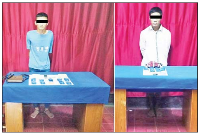
စိုင်းအွမ်(ခ)အိုက်ရှန် နှင့် ပေါလိုတို့အား သိမ်းဆည်းရမိသည့် စိတ်ကြွရူးသွပ်ဆေးပြားများနှင့်အတူ တွေ့ရစဉ်။