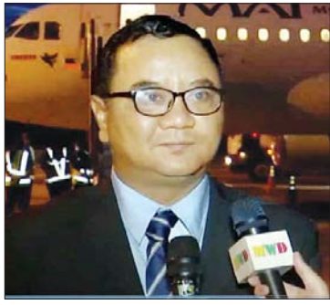
ဗိုလ်ချုပ်ဇော်မင်းထွန်း

ရုရှားခရီးစဉ်အတွင်း (၇)ကြိမ်မြောက် အရှေ့ဖျားစီးပွားရေးဖိုရမ်သို့ တက်ရောက်ခြင်း၊ ရုရှားဖက်ဒရေးရှင်းနိုင်ငံအစိုးရအဖွဲ့ တာဝန်ရှိသူများနှင့် တွေ့ဆုံဆွေးနွေးခြင်း၊ ရုရှားဖက်ဒရေးရှင်းနိုင်ငံရှိ အထင်ကရနေရာများ၊ တက္ကသိုလ်များနှင့် စက်ရုံ၊ အလုပ်ရုံများသို့ သွားရောက်လေ့လာခဲ့ခြင်းနှင့် ခရီးစဉ်တွင် လိုက်ပါလာသည့် ပြည်ထောင်စုဝန်ကြီးများ၊ ဒုတိယဝန်ကြီးများနှင့် တာဝန်ရှိသူများသည် သက်ဆိုင်ရာကဏ္ဍများအလိုက် အလုပ်သဘောဆိုင်ရာ တွေ့ဆုံဆွေးနွေးခြင်းများကို ဆောင်ရွက်ခဲ့ကြပြီး နှစ်နိုင်ငံအစိုးရနှင့် ပြည်သူများအကြား ချစ်ကြည်ရေး၊ စီးပွားရေးနှင့် ကဏ္ဍပေါင်းစုံတွင် ပူးပေါင်းဆောင်ရွက်မှုများ ပိုမိုတိုးတက်ခိုင်မာအောင် ဆောင်ရွက်ခဲ့ကြသည့် နိုင်ငံတော်စီမံအုပ်ချုပ်ရေးကောင်စီ ဥက္ကဋ္ဌ နိုင်ငံတော်ဝန်ကြီးချုပ် ဗိုလ်ချုပ်မှူးကြီးမင်းအောင်လှိုင်နှင့် အကြီးအကဲများသည် ယနေ့ညနေပိုင်းတွင် နေပြည်တော်လေဆိပ်သို့ ပြန်လည် ရောက်ရှိလာကြသည်။ ထိုသို့ပြန်လည်ရောက်ရှိလာကြသည့် နိုင်ငံတော်စီမံအုပ်ချုပ်ရေးကောင်စီ ဥက္ကဋ္ဌ နိုင်ငံတော်ဝန်ကြီးချုပ် ဗိုလ်ချုပ်မှူးကြီးမင်းအောင်လှိုင်နှင့် အကြီးအကဲများကို ဒေသခံပြည်သူများက ကြိုဆိုကြသည်။ အဆိုပါခရီးစဉ်တွင် လိုက်ပါခဲ့သောတာဝန်ရှိသူနှင့် လာရောက်ကြိုဆိုကြသူများ၏ စကားသံများကို မျှဝေပေးလိုက်ရပါသည်။