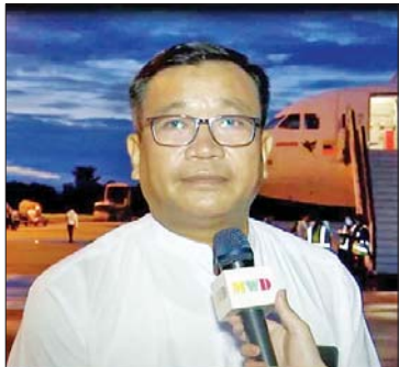
ဦးမောင်မောင်အောင်

ဒီကြိုးစားအားထုတ်မှုတွေကို နိုင်ငံတော် စီမံအုပ်ချုပ်ရေးကောင်စီ ဥက္ကဋ္ဌ နိုင်ငံတော်ဝန်ကြီးချုပ် ဗိုလ်ချုပ်မှူးကြီး မင်းအောင်လှိုင်အနေနဲ့ ခရီးစဉ်သွားခင် ကတည်းက အသေးစိတ်စီမံပြီး အောင်မြင်အောင် ဆောင်ရွက်ခဲ့ပါတယ်။ ဒီနေ့မှာ လာရောက်ကြိုဆိုတဲ့ ပြည်သူ လူထုကို ကျေးဇူးတင်ပါတယ်။ မှန်ကန် တဲ့လုပ်ငန်းစဉ်ကို ကျွန်တော်တို့ ဆောင်ရွက်နေပါတယ်။ နိုင်ငံတော်စီမံ အုပ်ချုပ်ရေးကောင်စီအနေနဲ့ ရည်မှန်း ချက်နှစ်ရပ်ဖြစ်တဲ့ နိုင်ငံရေးရည်မှန်းချက် ဖြစ်တဲ့ ပါတီစုံဒီမိုကရေစီစနစ် ခိုင်မာ စေရေး၊ ဒီမိုကရေစီနဲ့ ဖက်ဒရယ်စနစ်ကို အခြေခံတဲ့ ပြည်ထောင်စုစနစ် တည်ဆောက် ခိုင်မာစေရေး ကိစ္စများကို ဆောင်ရွက်နေပါတယ်။ ဒီကိစ္စတွေက ဒီခရီးစဉ်က ပိုမိုခိုင်မာစေမယ်လို့ ယုံကြည်ပါတယ်။ ဦးမိုးဟိန်း ရုရှားဖက်ဒရေးရှင်းနိုင်ငံ သမ္မတ က နိုင်ငံတော်ဝန်ကြီးချုပ်ကို တစ်နာရီနဲ့ မိနစ် ၂၀ ကြာသီးခြားတွေ့ဆုံပြီး မြန်မာနဲ့ ရုရှားအကြား ကမ္ဘာ့ကိစ္စ၊ မြန်မာ့ကိစ္စ များကို ပူးပေါင်းဆောင်ရွက်ဖို့ အလေး အနက်စကားတွေကို နှစ်ဦးတည်းပြော ကြားသွားတယ်။ ကြည့်ရတာ အင်မတန် ဝမ်းသာတယ်။ ရုရှားဖက်ဒရေးရှင်း နိုင်ငံ သမ္မတလို ကမ္ဘာ့ခေါင်းဆောင်ကြီးက မြန်မာနိုင်ငံအစိုးရနဲ့ မြန်မာနိုင်ငံ ဝန်ကြီးချုပ်ကိုရော၊ မြန်မာနိုင်ငံကိုပါ အသိအမှတ်ပြုတာကိုမြင်ရတဲ့အခါမှာ ဝမ်းသာတာကို စကားလုံးနဲ့ဖော်ပြလို့မရ ပါဘူး။ နိုင်ငံတော်သစ်ကိုတည်ဖို့ ဗိုလ်ချုပ်မှူးကြီး မင်းအောင်လှိုင် ကြိုးစား ခဲ့တာ အောင်မြင်ခဲ့ပါပြီလို့ ပြောချင် ပါတယ်။