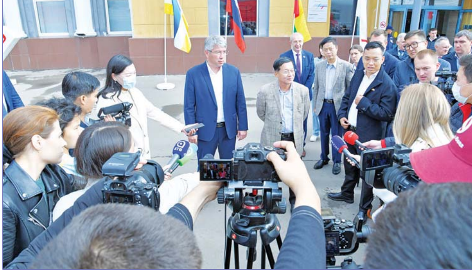
နိုင်ငံတော်စီမံအုပ်ချုပ်ရေးကောင်စီဥက္ကဋ္ဌ နိုင်ငံတော်ဝန်ကြီးချုပ် ဗိုလ်ချုပ်မှူးကြီး မင်းအောင်လှိုင် Republic of Buryatia ပြည်နယ်မှ သတင်းမီဒီယာများ၏ သိရှိလိုသည့်မေးမြန်းမှုများကို ဖြေကြားစဉ်။