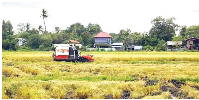
ကျေးရွာတစ်ရွာ၌ ဆီထွက်သီးနှံနည်းပညာပေးချက်များ ရိတ်သိမ်းနေစဉ်။

၂၀၂၂-၂၀၂၃ ဘဏ္ဍာနှစ်တွင် ပြည်တွင်းစားသုံးဆီ ဖူလုံရေးအတွက် ဆီထွက်သီးနှံများ တိုးချဲ့စိုက်ပျိုးရေးကော်မတီ၏ လမ်းညွှန်မှုဖြင့် နေကြာအပါအဝင် ဆီထွက်သီးနှံများ စိုက်ပျိုးသော ကျေးရွာများရှိ တောင်သူများအား တိုးချဲ့အကောင်အထည်ဖော် ဆောင်ရွက်နိုင်စေရန် ရည်ရွယ်၍ မြစ်မီးရောင်ကျေးရွာစီမံကိန်း (ဆီထွက်သီးနှံ) ကို မန္တလေးတိုင်းဒေသကြီးအတွင်းရှိ ကျေးရွာ ၇၄ ရွာ၌ အကောင်အထည်ဖော်ဆောင်ရွက်ပေးမည်ဖြစ်ကြောင်း တိုင်းဒေသကြီး ကျေးလက်ဒေသဖွံ့ဖြိုးတိုးတက်ရေးဦးစီးဌာနမှ သိရသည်။