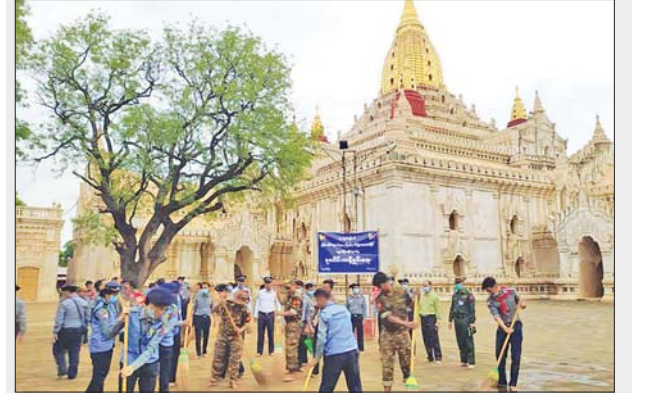
အောက်တိုဘာ ၁ ရက်တွင် ကျရောက်မည့် (၅၈) နှစ်မြောက် မြန်မာနိုင်ငံ ရဲတပ်ဖွဲ့နေ့ကို ဂုဏ်ပြုကြိုဆိုသောအားဖြင့် ညောင်ဦးခရိုင် စီမံအုပ်ချုပ်ရေးအဖွဲ့၊ ညောင်ဦးခရိုင် ရဲတပ်ဖွဲ့နှင့် မြို့နယ်ရဲတပ်ဖွဲ့မှူးတို့ ဦးဆောင်သော ရဲတပ်ဖွဲ့ဝင်များက ပုဂံမြို့ဟောင်းရှိ အာနန္ဒာဘုရားဝင်းအတွင်း စုပေါင်းသန့်ရှင်းရေးလုပ်ငန်းများကို စက်တင်ဘာ ၁၀ ရက်က ဆောင်ရွက်ပေးစဉ်။ဝင်းထိန်(ပြန်/ဆက်)

အဆိုပါကျေးရွာများ၌ ၂၀၂၂ - ၂၀၂၃ ဘဏ္ဍာနှစ်တွင် မြစ်မီးရောင် ကျေးရွာစီမံကိန်း (ဆီထွက်သီးနှံ) လည်ပတ်ရန်ပုံငွေများကို အမျိုးအစားအလိုက် ထောက်ပံ့ပေးမည်ဖြစ်ပြီး ချေးငွေအထောက်အပံ့ဖြင့် စိုက်ပျိုးရေးလုပ်ငန်းများအနက်မှ နေကြာအပါအဝင် ဆီထွက်သီးနှံစိုက်ပျိုးသောတောင်သူများကို ပထမဦးစားပေး၍ အခြားအဆီထွက်သီးနှံစိုက်ပျိုးသော တောင်သူများကို ဒုတိယဦးစားပေး၊ အခြားသီးနှံစိုက်ပျိုးသော တောင်သူများကို တတိယဦးစားပေးနှင့် အခြားအသက်မွေးဝမ်းကျောင်းလုပ်ငန်း ဆောင်ရွက်သူများအပါအဝင် ၎င်းတို့လိုအပ်မည့် မျိုးစေ့၊ သွင်းအားစုနှင့် စိုက်ပျိုးစရိတ်များအတွက် အတိုးနှုန်းသက်သာသော ချေးငွေများဖြင့် အရင်းမပျောက်မတည်ရန်ပုံငွေများ ပံ့ပိုးပေးနိုင်ရန် ရည်ရွယ်၍ဆောင်ရွက်ပေးခြင်းဖြစ်ကြောင်း သိရသည်။ မင်းထက်အောင် (မန်းကိုယ်ပွား)