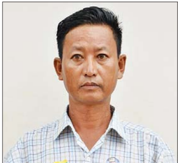
ဦးဇော်တူးအောင်

တယ်။ ရုရှားဖက်ဒရေးရှင်းနိုင်ငံအနေနဲ့ ကျွန်မတို့ မြန်မာနိုင်ငံကို အခက်အခဲ အကျပ်အတည်းပေါင်းစုံ ကြားကနေပြီး လက်ကမ်းကြိုဆိုပြီး ပူးပေါင်းဆောင်ရွက် ပေးတဲ့အတွက် ဒီနေရာကနေပြီး ရုရှား ဖက်ဒရေးရှင်းနိုင်ငံ သမ္မတကိုလည်း ကျေးဇူးအများကြီးတင်ပါတယ်။ မြန်မာ နိုင်ငံသူ နိုင်ငံသားတွေအတွက် အောင်မြင်မှုတွေ၊ နိုင်ငံ့ဂုဏ်နဲ့ နိုင်ငံသူ နိုင်ငံသား တစ်ယောက်ချင်းစီရဲ့ မျှော်လင့်ချက်တွေကို ဖြည့်ဆည်းပေးတဲ့ အတွက် နိုင်ငံတော်ဝန်ကြီးချုပ်ကိုလည်း ကျေးဇူးအများကြီးတင်ပါတယ်။ ရုရှား ဖက်ဒရေးရှင်းနိုင်ငံနဲ့ မြန်မာနိုင်ငံ ပူးပေါင်း ဆောင်ရွက်တဲ့အတွက် လူငယ်တွေအနေ နဲ့လည်း အခွင့်အလမ်းတွေအများကြီး တိုးပွားလာပါတယ်။ လူငယ်တွေအားလုံး ရဲ့ကိုယ်စား ကျွန်မအနေနဲ့ကျေးဇူးတင် ပါတယ်။ ရုရှား-မြန်မာ ချစ်ကြည်ရေး အခွန်ရှည် တည်တံ့ခိုင်မြဲပါစေ၊ နိုင်ငံတော်ဝန်ကြီးချုပ် ဗိုလ်ချုပ်မှူးကြီး မင်းအောင်လှိုင် ကျန်းမာပါစေ။ ဦးဇော်တူးအောင် အခုလာရောက် ကြိုဆိုတဲ့အဖွဲ့မှာ ကျွန်တော်အပါအဝင် ပျဉ်းမနားမြို့နယ် က တပ်မတော်ထောက်ခံသူအင်အား ၁၀၀ ကျော် ပါဝင်ပါတယ်။ နိုင်ငံတော် ဝန်ကြီးချုပ်အနေနဲ့ ရုရှားဖက်ဒရေးရှင်း နိုင်ငံကိုသွားရောက်ပြီးတော့ နှစ်နိုင်ငံ ချစ်ကြည်ရေး ပိုမိုခိုင်မာအောင် ဆောင်ရွက်ခဲ့တဲ့အပြင် ကမ္ဘာ့နိုင်ငံတွေ ရဲ့အလယ်မှာ ကျွန်တော်တို့မြန်မာနိုင်ငံရဲ့ အင်အားကို ပြသနိုင်ခဲ့တဲ့အတွက် အခုလို လာရောက်ပြီး ဂုဏ်ပြုကြိုဆိုတာဖြစ် ပါတယ်။ ကျွန်တော်တို့ရဲ့နှလုံးသားထဲက လှိုက်လှိုက်လှဲလှဲနဲ့ လာရောက်ကြိုဆို တာဖြစ်ပါတယ်။ ကျွန်တော်တို့ မြန်မာ