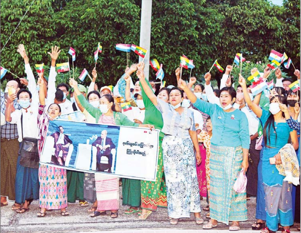
နိုင်ငံတော်စီမံအုပ်ချုပ်ရေးကောင်စီဥက္ကဋ္ဌ နိုင်ငံတော်ဝန်ကြီးချုပ် ဗိုလ်ချုပ်မှူးကြီး မင်းအောင်လှိုင် ဦးဆောင်သည့် အဆင့်မြင့်ကိုယ်စားလှယ်အဖွဲ့အား တိုင်းရင်းသားပြည်သူများက သောင်းသောင်းဖြဖြ ကြိုဆိုနှုတ်ဆက်စဉ်။