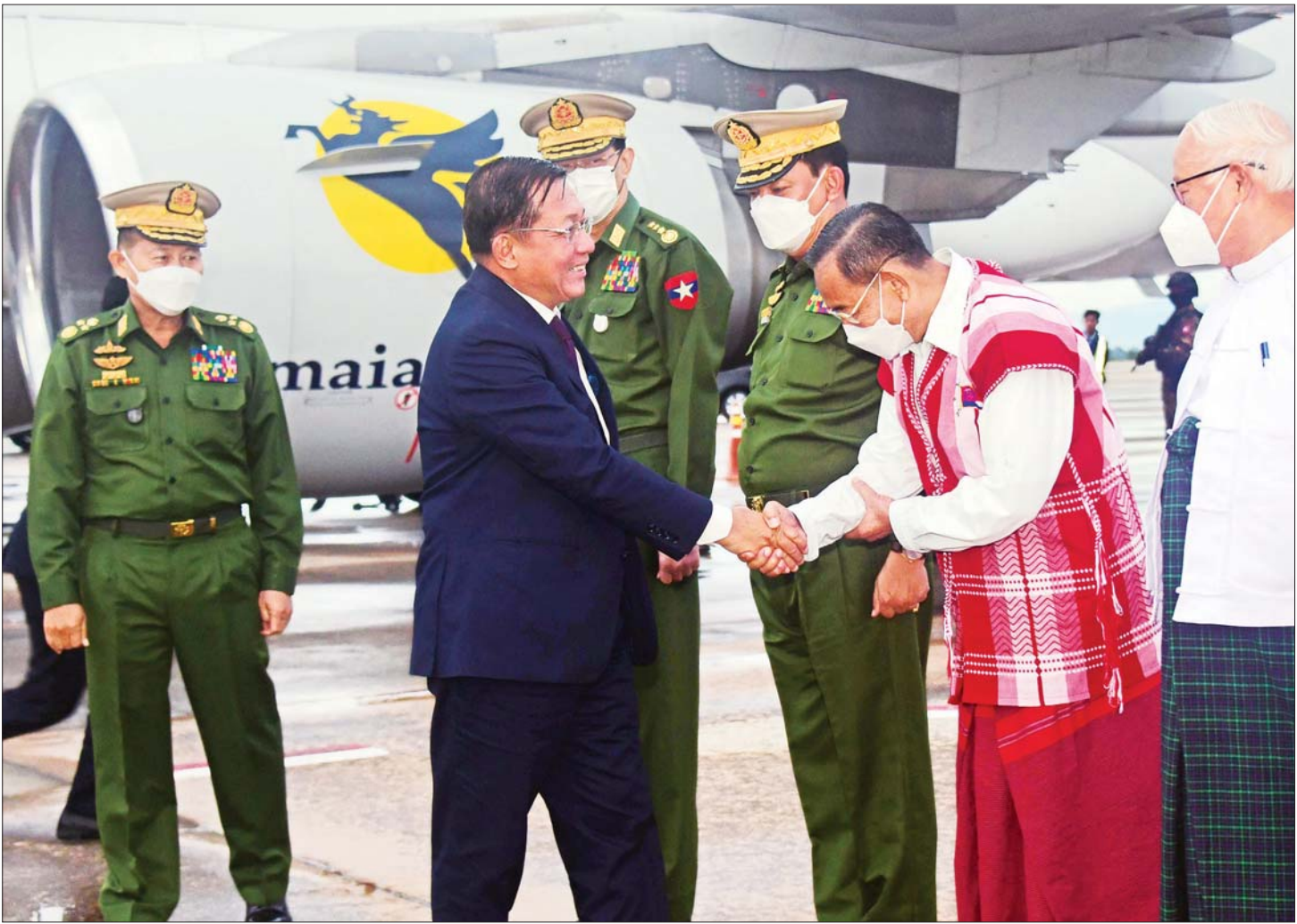
နိုင်ငံတော်စီမံအုပ်ချုပ်ရေးကောင်စီဥက္ကဋ္ဌ နိုင်ငံတော်ဝန်ကြီးချုပ် ဗိုလ်ချုပ်မှူးကြီး မင်းအောင်လှိုင် အား ကောင်စီဒုတိယဥက္ကဋ္ဌ ဒုတိယဝန်ကြီးချုပ် ဒုတိယ ဗိုလ်ချုပ်မှူးကြီး စိုးဝင်း၊ ကောင်စီဝင်များ၊ ကောင်စီအတွင်းရေးမှူး၊ ပြည်ထောင်စုဝန်ကြီးများနှင့် တာဝန်ရှိသူများက နေပြည်တော် တပ်မတော်လေဆိပ်၌ ကြိုဆိုနှုတ်ဆက်ကြစဉ်။

နိုင်ငံတော်စီမံအုပ်ချုပ်ရေးကောင်စီဥက္ကဋ္ဌ နိုင်ငံ တော်ဝန်ကြီးချုပ် ဦးဆောင်သည့် ကိုယ်စားလှယ်အဖွဲ့ သည် ညနေပိုင်းတွင် နေပြည်တော် တပ်မတော် လေဆိပ်သို့ ပြန်လည်ရောက်ရှိကြရာ ကောင်စီဒုတိယ ဥက္ကဋ္ဌ ဒုတိယဝန်ကြီးချုပ် ဒုတိယ ဗိုလ်ချုပ်မှူးကြီး စိုးဝင်း၊ ကောင်စီဝင်များ၊ ကောင်စီအတွင်းရေးမှူး၊ ပြည်ထောင်စုဝန်ကြီးများ၊ ကာကွယ်ရေးဦးစီးချုပ်ရုံး (ကြည်း)မှ တပ်မတော်အရာရှိကြီးများ၊ နေပြည်တော် တိုင်း စစ်ဌာနချုပ်တိုင်းမှူး၊ မြန်မာနိုင်ငံဆိုင်ရာ ရုရှား ဖက်ဒရေးရှင်းနိုင်ငံသံရုံးမှ သံရုံးဒုတိယ အကြီးအက