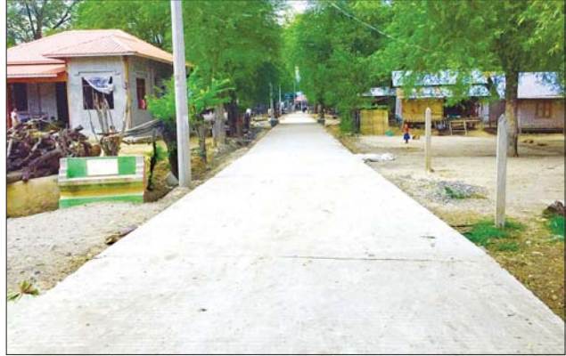
ကျေးရွာတစ်ရွာ၌ စီမံကိန်းရန်ပုံငွေဖြင့် ဆောင်ရွက်ထားသော ရွာတွင်းလမ်းတစ်လမ်း။