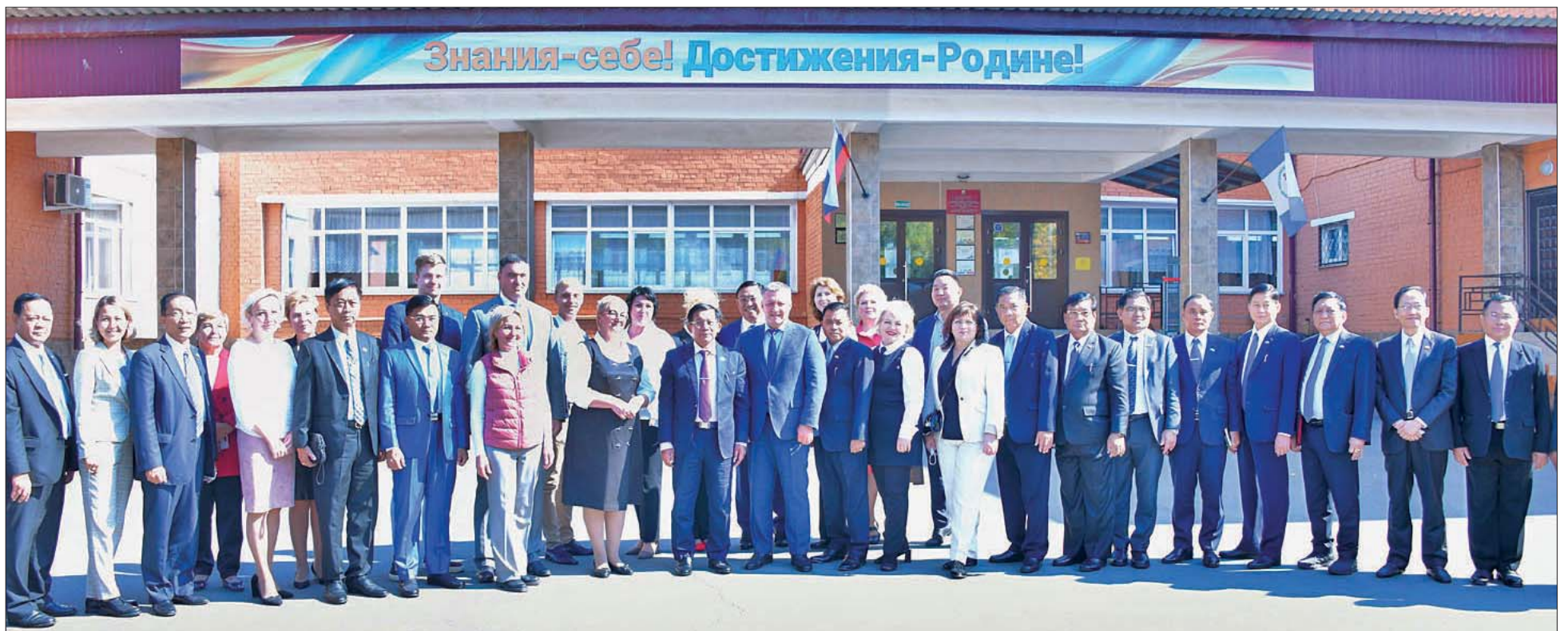
နိုင်ငံတော်စီမံအုပ်ချုပ်ရေးကောင်စီဥက္ကဋ္ဌ နိုင်ငံတော်ဝန်ကြီးချုပ် ဗိုလ်ချုပ်မှူးကြီး မင်းအောင်လှိုင်နှင့်အဖွဲ့ဝင်များ Irkutsk ပြည်နယ်အစိုးရအဖွဲ့ အကြီးအကဲ၊ ကျောင်းအုပ်ကြီး၊ အဖွဲ့ဝင်များနှင့်အတူ စုပေါင်းမှတ်တမ်းတင် ဓာတ်ပုံရိုက်စဉ်။