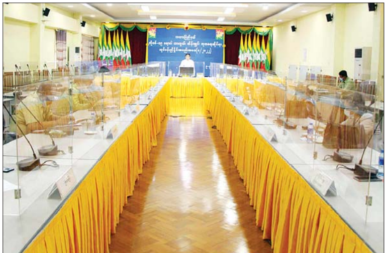
အဖွဲ့များက ပူးပေါင်းဆောင်ရွက်မည့် ကော်မတီဥက္ကဋ္ဌ ပြည်နယ်ဝန်ကြီးချုပ်က အခြေအနေများကို ဆွေးနွေးတင်ပြခဲ့ တင်ပြဆွေးနွေးမှုအပေါ် ညှိနှိုင်း ဆောင်ရွက်ပေးခဲ့ပြီး နိဂုံးချုပ် အမှာစကား ပြောကြားခဲ့သည်။ ထို့နောက် ကယားပြည်နယ် ကိုဗစ်- ၁၉ ထိန်းချုပ်ရေးနှင့် အရေးပေါ်တုံ့ပြန်ရေး ပြည်နယ် (ပြန်/ဆက်)

ပြည်နယ်ဝန်ကြီးချုပ်က ကယား ရောဂါဖြစ်ပွားလာပါက ကုသရေးအတွက် များက လုပ်ငန်းကဏ္ဍအသီးသီးကို ပြည်နယ်၌ ကိုဗစ်-၁၉ ရောဂါကူးစက်မြန် ကြိုတင်စီမံပြင်ဆင်ထားရန်၊ အထောက်အကူပြုပစ္စည်းများ အဆင်သင့်ရှိစေရေး၊ အရှိန်အဟုန်မြှင့် ဆောင်ရွက်သွားကြရန် ပြောကြားသည်။ (ယာပုံ) လုံလောက်မှုရှိစေရေး စီစဉ်ဆောင်ရွက် ဆက်လက်၍ ကယားပြည်နယ် စောင့်ရှောက် ကုသနိုင်ရေးအတွက် ထားရန်၊ အသိပညာပေးလုပ်ငန်းများကို ကိုဗစ်- ၁၉ ထိန်းချုပ်ရေးနှင့် အရေးပေါ် ကြိုတင်ကာကွယ်ရေး လုပ်ငန်းများကို ကျယ်ကျယ်ပြန့်ပြန့် ဆောင်ရွက်ရန်၊ တုံ့ပြန်ရေးကော်မတီ၊ အတွင်းရေးမှူး ဗိုလ်မှူးကြီး မြင့်ဝေက ကိုဗစ်-၁၉ ရောဂါ ဆောင်ရွက်ရာတွင် ထုတ်ပြန်ထားသည့် ကာကွယ်ဆေးထိုး လုပ်ငန်းများကိုလည်း ကာကွယ်ဆေးထိုး လုပ်ငန်းများကို မြို့နယ်အသီးသီး၌ သတ်မှတ်ကာလ အတွင်း ရာနှုန်းပြည့် ထိုးနှံနိုင်ရေးအတွက် ခြံ့ပြည်နယ်အတွင်း လက်ရှိဆောင်ရွက် နေမှုနှင့် ဆက်လက်ဆောင်ရွက်မည့် အစီအမံများကို ရှင်းလင်းဆွေးနွေးပြီး တက်ရောက်လာကြသည့် ပြည်နယ် ကော်မတီအဖွဲ့ဝင်များနှင့် လူမှုရေးအသင်း ကော်မတီဝင်