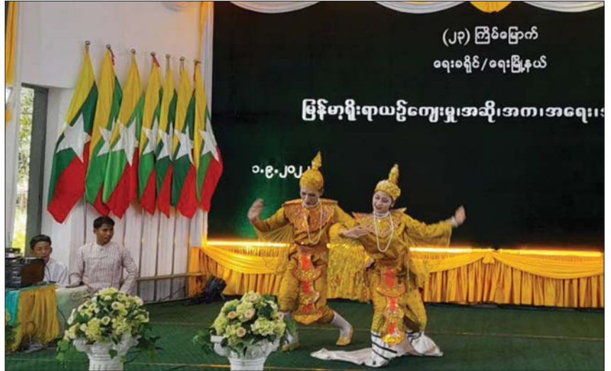
(၂၃) ကြိမ်မြောက် ရေးခရိုင်/ရေးမြို့နယ် မြန်မာ့ရိုးရာယဉ်ကျေးမှုအဆို၊အက၊အရေး၊ အတီးပြိုင်ပွဲ

ထိန်းသိမ်းပြီး မျိုးဆက်သစ်လူငယ်များထံ သို့ လက်ဆင့်ကမ်းပေးနိုင်ရန် ကျင်းပခြင်း ဖြစ်ကြောင်း ပြောကြားပြီး မွန်စာပေနှင့် ယဉ်ကျေးမှုကော်မတီက မွန်ရိုးရာအဆို အက များဖြင့် ဖျော်ဖြေတင်ဆက်သည်။ ထို့နောက် ဝါသနာရှင် (ဒုတိယတန်း) အဆင့် တီးလုံးအကပြိုင်ပွဲဝင် တစ်ဦး၊ ဝါသနာရှင်(ပထမတန်း)အဆင့် ခေတ်ဟောင်း ကာလပေါ်အဆိုပြိုင်ပွဲဝင်တစ်ဦး၊ ဝါသနာရှင် (ဒုတိယတန်း) အဆင့် ခေတ်ဟောင်းကာလ ပေါ်အဆိုပြိုင်ပွဲဝင်တစ်ဦး၊ အရေးပြိုင်ပွဲဝင် တစ်ဦး၊ မွန်ရိုးရာခေတ်ဟောင်း ကာလပေါ် အဆိုပြိုင်ပွဲဝင်တစ်ဦး၊ မွန်ရိုးရာအလွတ်တန်း ယိမ်းအဖွဲ့တစ်ဖွဲ့၊ မွန်ရိုးရာတပင်တိုင်အက ပြိုင်ပွဲဝင်တစ်ဦးတို့ ပါဝင်ယှဉ်ပြိုင်ခဲ့ပြီး ပြိုင်ပွဲဝင် များအား ခရိုင်စီမံအုပ်ချုပ်ရေးအဖွဲ့ဥက္ကဋ္ဌက ဂုဏ်ပြုငွေကျပ်ငါးသိန်း၊ ဆန်လေးအိတ်နှင့် ဆီ ၁၀ ပိဿာကို ဂုဏ်ပြုပေးအပ်သည်။ မြို့နယ်(ပြန်/ဆက်)