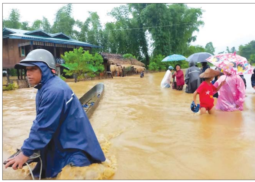
များကို ဆောင်ရွက်ပေးလျက်ရှိကြောင်း သိရ သည်။ အဆိုပါရေဝင်ရောက်သည့် နေရာများ သည် မြေနိမ့်ပိုင်းဖြစ်ခြင်းကြောင့် နှစ်စဉ် မိုးတွင်းကာလတွင် ရေဝင်ရောက်လေ့ရှိပြီး ယနေ့ဖြစ်စဉ်တွင် လူနှင့်တိရစ္ဆာန်များ ထိခိုက် သေဆုံးမှု မရှိကြောင်းနှင့် လက်ရှိအချိန်တွင် ပူတာအို - မချမ်းဘော့ - ဖရူခ - နောင်မွန် ကားလမ်းပေါ်၌ နှစ်မိုင်ခန့် ရေကျော်လျက် ရှိကြောင်း သိရသည်။ မြို့နယ် (ပြန်/ဆက်)

နောင်မွန်း စက်တင်ဘာ ၄ ကချင်ပြည်နယ် နောင်မွန်းမြို့နယ်၌ မိုးသည်း ထန်စွာအဆက်မပြတ် ရွာသွန်းမှုကြောင့် စက်တင်ဘာ ၃ ရက်က မြို့အဝင် လမ်းပေါ် ရေကျော်ခဲ့ပြီး အမှတ်(၂)ရပ်ကွက် မြေနိမ့်ပိုင်းရှိ လူနေအိမ်အချို့သို့ ရေဝင်ရောက်မှုများ ဖြစ်ခဲ့ သည်။ နောင်မွန်းမြို့နယ်၌ စက်တင်ဘာ ၂ ရက် ညနေ ၅ နာရီမှစတင်ပြီး မိုးသည်းထန်စွာ ရွာသွန်းခဲ့ရာ စက်တင်ဘာ ၃ ရက်တွင် ကဆန် ချောင်းကွန်ကရစ်မြေထိန်းနံရံအထက် နှစ်ပေ ခန့် ရေကျော်ခဲ့ကာ မြေနိမ့်ပိုင်းဖြစ်သည့် မြို့အဝင်ကတ္တရာလမ်းတစ်လျှောက် နှစ်မိုင်ခန့် ရေကျော်ခြင်း၊ အမှတ်(၂) ရပ်ကွက်ရှိ လူနေအိမ် ကိုးအိမ်အတွင်းသို့ ရေဝင်ရောက်ခြင်းများ ဖြစ် ပေါ်ခဲ့သည်။ ထိုသို့ရေဝင်ရောက်ခဲ့သည့် လူနေ အိမ်များသို့ မြို့နယ်စီမံအုပ်ချုပ်ရေးအဖွဲ့ဥက္ကဋ္ဌ ၏ ဦးဆောင်မှုဖြင့် မြို့နယ်ရဲတပ်ဖွဲ့၊ မီးသတ် တပ်ဖွဲ့နှင့် ပြည်သူများပူးပေါင်းကာ ကယ်ဆယ် ရေးလုပ်ငန်းများ ကြိုတင်ကာကွယ်ရေးလုပ်ငန်း