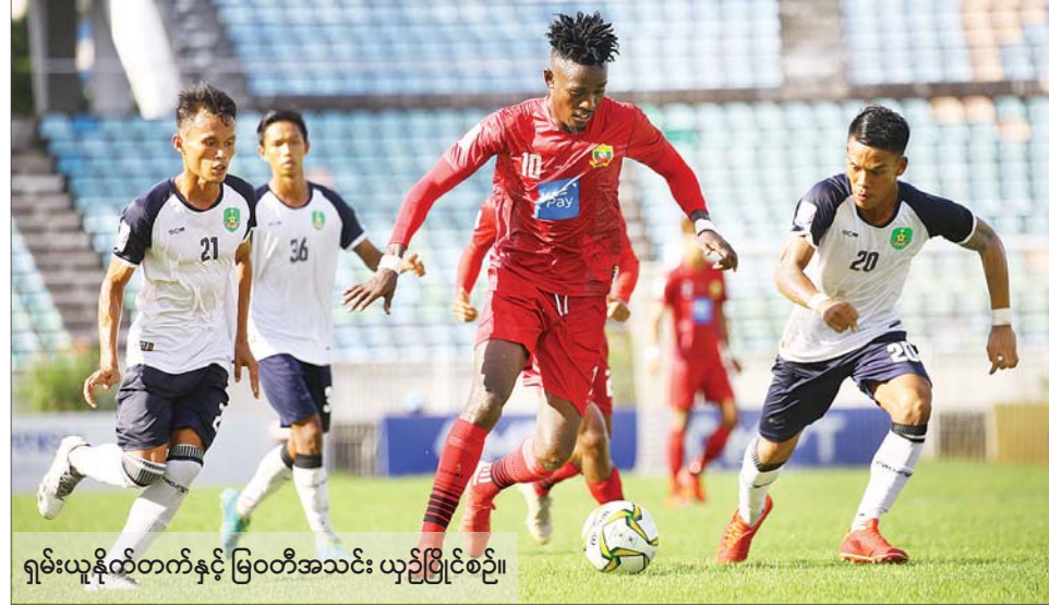
ရှမ်းယူနိုက်တက်နှင့် မြဝတီအသင်း ယှဉ်ပြိုင်စဉ်။

ရန်ကုန် စက်တင်ဘာ ၄ ၂၀၂၂ ရာသီ MNL အမှတ်ပေးပြိုင်ပွဲ ဒုတိယအကျော့ ပွဲစဉ် (၁၀) ပထမနှင့် ဒုတိယနေ့ကို စက်တင်ဘာ ၃၊ ၄ ရက်က သုဝဏ္ဏကွင်း၌ ကျင်းပရာ လက်ရှိချန်ပီယံ ရှမ်းယူနိုက်တက်အသင်းနှင့် ရတနာပုံအသင်း နိုင်ပွဲ ရရှိခဲ့သည်။ စက်တင်ဘာ ၃ ရက်က ကျင်းပသည့်ပွဲတွင် ရှမ်းယူနိုက်တက်အသင်းက မြဝတီအသင်းကို တစ်ဂိုး-ဂိုးမရှိဖြင့် အနိုင်ရခဲ့သည်။ လက်ရှိချန်ပီယံ ရှမ်းယူနိုက်တက်အသင်းသည် ယခုရာသီတွင် အမှားအယွင်းမရှိသေးဘဲ ဒုတိယအကျော့အဖွင့်ပွဲတွင် လည်း နိုင်ပွဲရယူကာ ဇယားထိပ်ဆုံးတွင် အမှတ်ဖြတ် ဦးဆောင်လျက်ရှိသည်။ မြဝတီအသင်း ရုန်းကန်မှု ကြောင့် ရှမ်းယူနိုက်တက်အသင်း ခက်ခက်ခဲခဲ ကစားခဲ့ရသော်လည်း နောက်ကျဂိုးဖြင့် စာမျက်နှာ ၁၈ ကော်လံ ၅ ၀