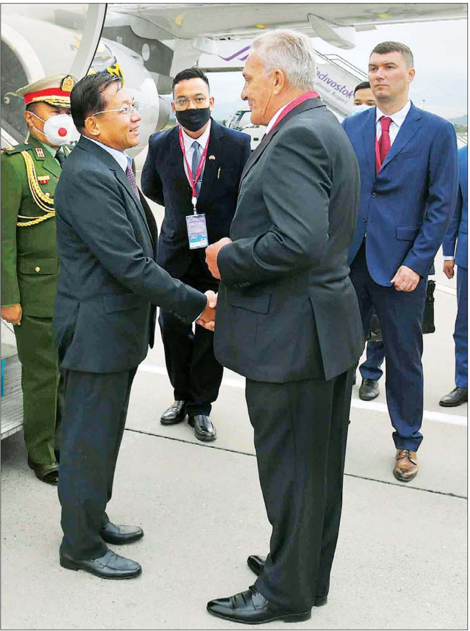
နိုင်ငံတော်စီမံအုပ်ချုပ်ရေးကောင်စီဥက္ကဋ္ဌ နိုင်ငံတော်ဝန်ကြီးချုပ် ဗိုလ်ချုပ်မှူးကြီး မင်းအောင်လှိုင် အား ရုရှားဖက်ဒရေးရှင်းနိုင်ငံ ဗလာဒီဗော့စတော့ခ် အပြည်ပြည်ဆိုင်ရာလေဆိပ်၌ တာဝန်ရှိသူများက ကြိုဆိုနှုတ်ဆက်စဉ်။

နိုင်ငံတော်စီမံအုပ်ချုပ်ရေးကောင်စီဥက္ကဋ္ဌ နိုင်ငံ တော်ဝန်ကြီးချုပ် ဦးဆောင်သည့် မြန်မာအဆင့်မြင့် ကိုယ်စားလှယ်အဖွဲ့သည် ရုရှားဖက်ဒရေးရှင်းနိုင်ငံ ဗလာဒီဗော့စတော့ခ် အပြည်ပြည်ဆိုင်ရာလေဆိပ်သို့ ဒေသစံတော်ချိန် ညနေပိုင်းတွင် ရောက်ရှိကြရာ ဗလာဒီဗော့စတော့ခ် ဒုတိယပြည်နယ်အုပ်ချုပ်ရေးမှူး Mr. Stegnyy Daria နှင့် တာဝန်ရှိသူများ၊ ရုရှားနိုင်ငံ ဆိုင်ရာ မြန်မာနိုင်ငံသံအမတ်ကြီး ဦးလွင်ဦးနှင့် မြန်မာစစ်သံ (ကြည်း၊ ရေ၊ လေ) ဗိုလ်မှူးချုပ် မိုးကျော်၊ နိုင်ငံခြားရေးဝန်ကြီးဌာန သံတမန်ရေးရာ ဦးစီးဌာန ညွှန်ကြားရေးမှူးချုပ်နှင့် တာဝန်ရှိ သူများက ကြိုဆိုနှုတ်ဆက်ခဲ့ကြကြောင်း သတင်း ရရှိသည်။