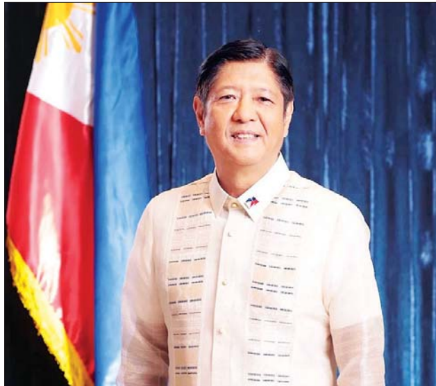
ဖိလစ်ပိုင်သမ္မတ ဖာဒီနန်ရိုမီဒက်စ်မားကိုစ်။

သောကုန်သွယ်မှုနှင့် ရင်းနှီးမြှုပ်နှံမှုဆက်ဆံရေး အလားအလာများကို အသုံးပြုရန် ကြိုးပမ်းသွားမည် ဖြစ်ကြောင်း ဂျကာတာမြို့သို့ မထွက်ခွာမီ မားကိုစ်က အတိုချုပ် ပြောကြားသည်။ ဂျကာတာမြို့တွင် ဖိလစ်ပိုင်နှင့် အင်ဒိုနီးရှား နှစ်နိုင်ငံဆက်ဆံရေးကြား လက်ရှိအခြေအနေနှင့် အနာဂတ်တွင် မြင်တွေ့နိုင်သလို ကမ္ဘာလုံးဆိုင်ရာ ပတ်ဝန်းကျင်နှင့်ဆိုင်သည့် ပတ်ဝန်းကျင် ပြောင်းလဲမှုကို အင်ဒိုနီးရှားနိုင်ငံ သမ္မတ ဂျိုကိုဝီဒိုဒိုနှင့် ဆွေးနွေး သွားမည်ဖြစ်ကြောင်း ဖိလစ်ပိုင် သမ္မတ မားကိုစ်က ပြောကြား သည်။ အင်ဒိုနီးရှားနိုင်ငံနှင့် စင်ကာပူ နိုင်ငံသို့ ၎င်း၏ နိုင်ငံတော်ခရီး