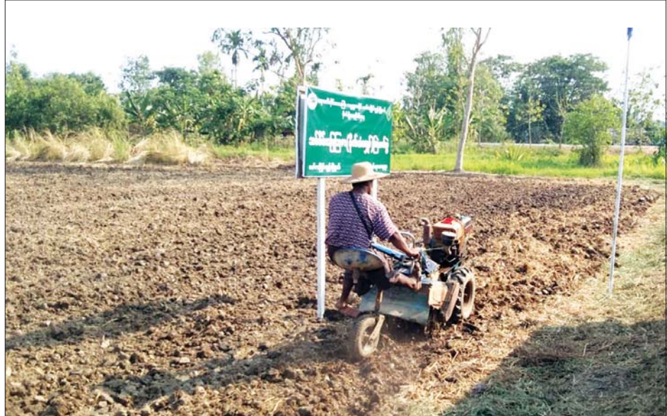
ပိုက်ဆံလျှော်များကို ထွန်စက်ဖြင့် ထွန်ယက်၍ မြေကြီးတွင်းထည့်သွင်းပေးနေစဉ်။

သရုပ်ပြပွဲတွင်ဆင်းပွဲများအတွင်း တိုင်းဒေသကြီး ဝန်ကြီးချုပ်၊ တိုင်းဒေသကြီး စိုက်ပျိုးရေးဦးစီးမှူးနှင့် တာဝန်ရှိသူများက အသိပညာပေး ဆွေးနွေးခဲ့ကြ သည်။ ဒေသခံတောင်သူများကလည်း စိတ်ပါဝင် စားစွာ ပူးပေါင်းပါဝင်ကြကို အားရဖွယ် တွေ့ရှိ ရသည်။ လယ်ယာကဏ္ဍသည် မိမိတို့နိုင်ငံ၏ အဓိက စီးပွားရေးမောင်းနှင်အားတစ်ခုပင် ဖြစ်ပါသည်။ ထို့အတွက် မြေဆီမြေနှစ် ပြည့်ဝရေး၊ စိုက်ပျိုးရေး အတွက် မြေဩဇာသွင်းအားစုများ ကုန်ကျစရိတ် သက်သာရေး၊ သီးနှံအထွက်နှုန်း မြင့်မားရေးတို့ အတွက် လယ်ယာမြေများ၌ သစ်စိမ်းမြေဩဇာ (ပိုက်ဆံလျှော်)များကို ထည့်သွင်းသုံးစွဲခြင်းဖြင့် လယ်ယာကဏ္ဍကို မြှင့်တင်ကြပါစို့ဟု တိုက်တွန်း လိုက်ရပါတော့သည်။ ။