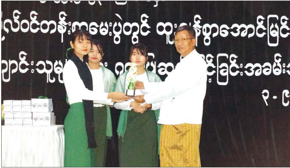
ပျိုးထောင်ပေးနိုင်မည်ဖြစ်ကြောင်း၊ ယခုစာမေးပွဲ ကြိုးစားသင်ယူကြရန် တိုက်တွန်းကြောင်း ပြောကြား တွင် ထူးချွန်စွာ အောင်မြင်ခဲ့ကြသည့် ကျောင်းသား သည်။ ထို့နောက် ပြည်ထောင်စုဝန်ကြီး(ငြိမ်း) သရေ ကျောင်းသူများအနေဖြင့်လည်း နိုင်ငံတော်အတွက် စည်သူ ဦးမြင့်လှိုင်က ဂုဏ်ပြုအမှာစကားပြောကြား အားကိုးအားထားရသည့် လူတော်လူကောင်းများ ပြီး နေပြည်တော်ကောင်စီဥက္ကဋ္ဌ ဦးတင်ဦးလွင်၊ ကြီးစားသင်ယူကြရန် တိုက်တွန်းကြောင်း ပြောကြား သည်။ ထို့နောက် ပြည်ထောင်စုဝန်ကြီး(ငြိမ်း) သရေ စည်သူ ဦးမြင့်လှိုင်က ဂုဏ်ပြုအမှာစကားပြောကြား ပြီး နေပြည်တော်ကောင်စီဥက္ကဋ္ဌ ဦးတင်ဦးလွင်၊

နေပြည်တော် စက်တင်ဘာ ၄ နေပြည်တော် ဒက္ခိဏသီရိမြို့နယ် အမှတ် (၁၈) အခြေခံပညာ အထက်တန်းကျောင်းမှ ၂၀၂၁-၂၀၂၂ ပညာသင်နှစ် တက္ကသိုလ်ဝင်စာမေးပွဲတွင် ထူးချွန်စွာ အောင်မြင်ခဲ့ကြသည့် ကျောင်းသား ကျောင်းသူများ အား ဂုဏ်ပြုဆုပေးအပ်ပွဲကို အဆိုပါကျောင်း၌ စက်တင်ဘာ ၃ ရက်က ကျင်းပသည်။