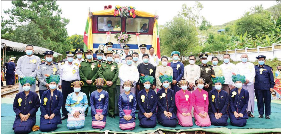
ရမ်းပြည်နယ်ဝန်ကြီးချုပ် ဒေါက်တာကျော်ထွန်းနှင့် တာဝန်ရှိသူများ တောင်ကြီး - ဆိုက်ခေါင်လမ်းပိုင်းရှိ တောင်ကြီး-ဘန်းယဉ်ခရီးစဉ်အမှတ် (၁၅၄)အဆန်း၊ အမှတ် (၁၅၄) အစုန်ရထား ပြန်လည်ပြေးဆွဲခြင်းအခမ်းအနားတွင် စုပေါင်းမှတ်တမ်း တင် ဓာတ်ပုံရိုက်စဉ်။

တောင်ကြီး - ဆိုက်ခေါင် လမ်းပိုင်းရှိ တောင်ကြီး-ဘန်းယဉ်ခရီးစဉ် အမှတ် (၁၅၄)အဆန်း၊ အမှတ် (၁၅၄)အစုန်ရထား ပြန်လည်ပြေးဆွဲခြင်း အခမ်းအနား ဖွင့်လှစ်ခြင်းသတင်းကို စက်တင်ဘာ ၁ ရက်နေ့ည မြဝတီရုပ်မြင်သံကြားသတင်း တွင် တွေ့မြင်လိုက်ရပါတယ်။ မီးရထား လမ်းပိုင်းဖွင့်လှစ်ခြင်း သတင်းဟာ သာမန်သတင်းတစ်ပုဒ်လို့ ထင်ရပေမယ့် စာရေးသူအတွက်ကတော့ တကယ့်ကို ကြည်နူးချမ်းမြေ့ဖွယ်သတင်းပဲ ဖြစ်ပါတယ်။ ဘာဖြစ်လို့လဲဆိုတော့ တောင်ကြီး - ဆိုက်ခေါင်ဒေသဆိုတာ ဟိုးအရင်က အလွန်ပဲလမ်းပန်း ဆက်သွယ်ရေးခက်ခဲတဲ့ ဒေသတစ်ခုဖြစ် ခဲ့လို့ပါပဲ။