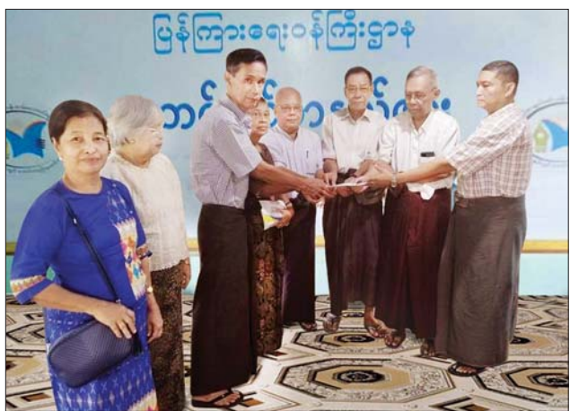
သတင်းနှင့် စာနယ်ဇင်းဝန်ထမ်းဟောင်းများအသင်းသို့ အလှူငွေပေးအပ်