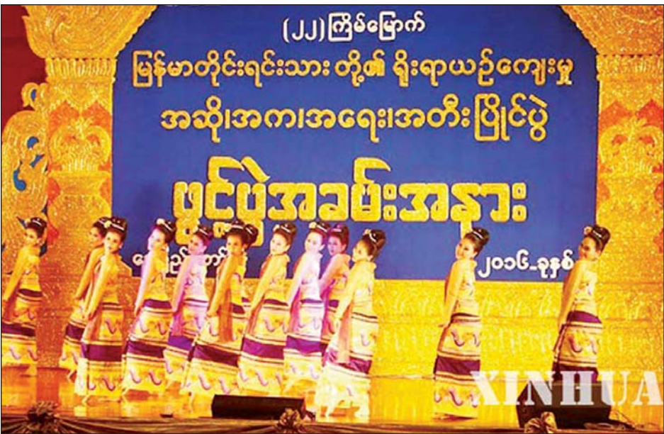
၂၀၁၆ ခုနှစ်က (၂၂)ကြိမ်မြောက် ရိုးရာယဉ်ကျေးမှု အဆို၊ အက၊ အရေး၊ အတီး ပြိုင်ပွဲ ဖွင့်ပွဲကို နေပြည်တော်၌ ကျင်းပစဉ်။

မြန်မာ့ အဆို အက အရေး အတီး၏ အစ လူ့ယဉ်ကျေးမှု၏အစသည် တေးဂီတနှင့် အကတို့မှပင် ဖြစ်ဟန်ရှိပါသည်။ ပျော်မြူးရွှင် ပျော်သည့်အခါဖြစ်စေ၊ စိတ်အားငယ်ညှိုးနွမ်းသည့် အခါ ဖြစ်စေ၊ စိတ်တက်ကြွသည့်အခါ ဖြစ်စေ ဖွင့်ဆို ထုတ်ဖော်ကြရာမှ တေးဂီတဖြစ်လာဟန် တူပါ သည်။ သားကောင်များလိုက်ရင်းဖြစ်စေ၊ စစ်ချီ