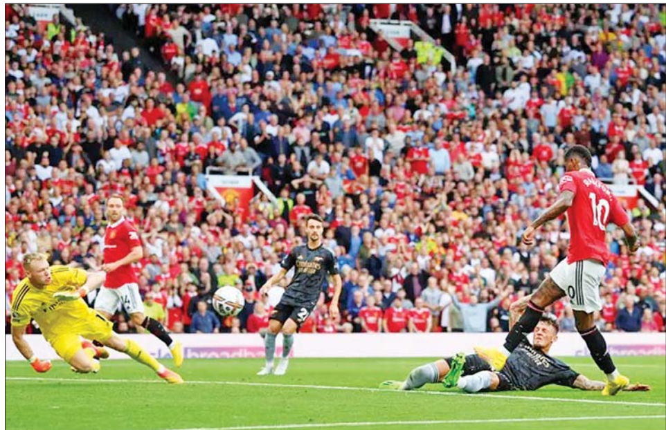
မန်ယူတိုက်စစ်မှူး ရက်ဖွဲဒ် အာဆင်နယ်အသင်းဘက်သို့ ဂိုးသွင်းယူစဉ်။