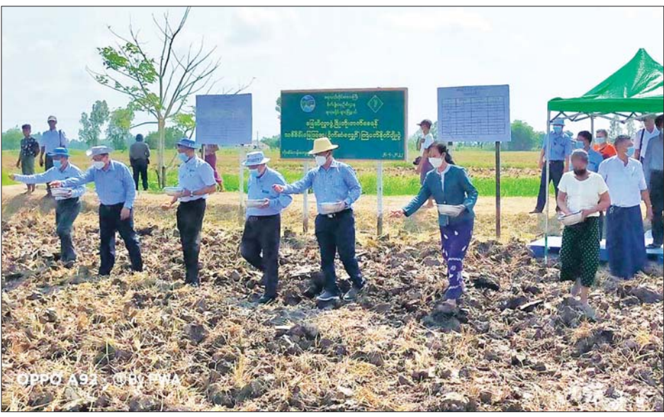
ဖျာပုံမြို့နယ်အတွင်း သစ်စိမ်းမြေဩဇာ(ပိုက်ဆံလျှော်) မျိုးစေ့များ ကြပ်ပတ်စိုက်ပျိုးနေစဉ်။

ထို့အတူ မိမိတို့နိုင်ငံတွင် ရာသီဥတုပြောင်းလဲမှု များကြောင့် သဘာဝအရင်းအမြစ်များ ဆုံးရှုံးမှု ရင်ဆိုင်နေကြရပါသည်။ ထို့ကြောင့်လည်း စဉ်ဆက် မပြတ် စိုက်ပျိုးထုတ်လုပ်မှုများ ရရှိရန် စိုက်ပျိုးရေး ဆိုင်ရာ သဘာဝအရင်းအမြစ်များကို ထိန်းသိမ်းရ မည် ဖြစ်သည်။ သို့မှသာ ရေရှည်တည်တံ့သည့် စိုက်ပျိုးရေးလုပ်ငန်းများ ရရှိခြင်းနှင့် မြေဆီလွှာ ကောင်းမွန်ခြင်း၊ အပင်အာဟာရကောင်းစွာ ရရှိခြင်း တို့ ရှိမည်ဖြစ်၍ စိုက်ပျိုးထုတ်လုပ်မှုများ တိုးတက် လာမည်ဖြစ်ပါသည်။