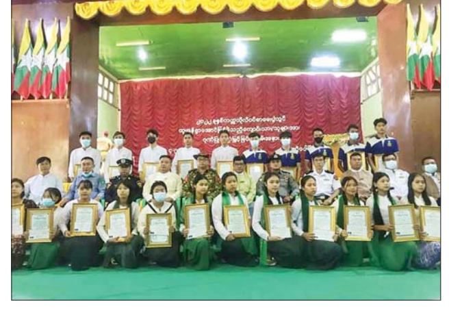
(၂) အထက်တန်းပြ ဆရာမ များ ပေးအပ်ကြောင်း သိရသည်။ ဒေါ်နွဲ့ယဉ်မျိုးထံ ဂုဏ်ပြုဆုငွေ စိုင်း(သီပေါ)

သီပေါ စက်တင်ဘာ ၄ ၂၀၂၁ - ၂၀၂၂ ပညာသင်နှစ် ထူးချွန်ကျောင်းသား ကျောင်းသူများအား မြို့နယ်စီမံအုပ်ချုပ်ရေးအဖွဲ့ ဥက္ကဋ္ဌ ဦးအောင်စိုးဝင်းနှင့် တာဝန် က သီပေါမြို့ မြို့တော်ခန်းမ၌ ကျင်းပရာ မြို့နယ်စီမံအုပ်ချုပ်ရေး အဖွဲ့ဥက္ကဋ္ဌ ဦးအောင်စိုးဝင်းက ဂုဏ်ပြုအမှာစကား ပြောကြား သည်။ ဆက်လက်၍ ထူးချွန်ဆုများ ချီးမြှင့်ရာ တစ်ဘာသာဂုဏ်ထူးရှင် ၁၂ ဦး၊ နှစ်ဘာသာဂုဏ်ထူးရှင် သုံးဦး၊ သုံးဘာသာဂုဏ်ထူးရှင်