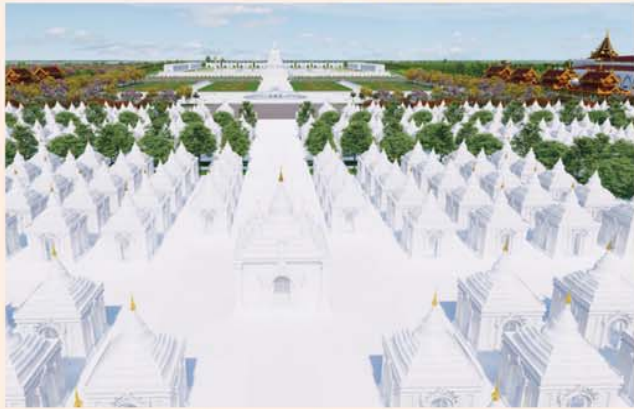
ကျောက်စာရုံစေတီ(၁၂ x ၁၂ x ၁၈)ပေ ၁ ဆူ တန်ဖိုး- ၂၇၉ သိန်း