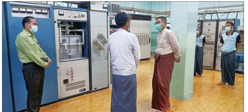
မွန်းလွဲပိုင်းတွင် ဒုတိယဝန်ကြီး ထပ်ဆင့်လွှင့်စက်ရုံတို့ကို ကြည့်ရှု ဂရုစိုက် ဆောင်ရွက်ရန်တို့ကို သည် ဘိုကလေးမြို့ရှိ ထပ်ဆင့် စစ်ဆေးပြီး စက်များ ကြည့်ရှုရေး မှာကြားခဲ့သည်။ လွှင့်စက်ရုံနှင့် ကျောင်းကုန်းမြို့ နှင့် ပျက်စီးမှု မရှိစေရေး၊ လုံခြုံရေး မြို့နယ်(ပြန်/ဆက်)

ကျောင်းကုန်း စက်တင်ဘာ ၄ များတို့အား တွေ့ဆုံကာ ပြန်/ဆက် ရုံးများကို ကြည့်ရှုစစ်ဆေး သည်။ ယနေ့ နံနက်ပိုင်းတွင် ဘိုကလေးမြို့နယ်ရုံး မော်လမြိုင် ကျွန်းမြို့နယ် ရုံးတို့အား ကြည့်ရှု စစ်ဆေးပြီး မွန်းလွဲပိုင်းတွင် ဝါးခယ်မမြို့နယ်ရုံး၊ အိမ်မဲမြို့နယ် ရုံးနှင့် ကျောင်းကုန်းမြို့နယ်ရုံး၊ ညနေပိုင်းတွင် ဓနုမြို့မြို့နယ်ရုံး တို့ကို ကြည့်ရှုစစ်ဆေးပြီး ဝန်ထမ်း များအား တွေ့ဆုံသည်။ ဒုတိယဝန်ကြီးက ဝန်ထမ်း များနှင့် တွေ့ဆုံစဉ် ကိုဗစ်-၁၉