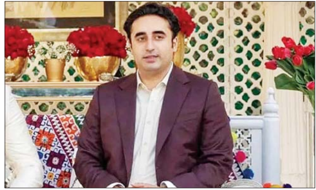
ပါကစ္စတန်နိုင်ငံခြားရေးဝန်ကြီး ဘယ်လဝယ်ဘီတိုဇာဒါရီ။

ပါကစ္စတန်နိုင်ငံ၌ ဇွန်လလယ်မှစကာ မုတ်သုံမိုးရွာသွန်းခြင်းနှင့် ရေကြီးမှုကြောင့် သေဆုံးသူ ၁၂၉၀ အထိ မြင့်တက်လာပြီး ၁၂၅၈၈ ဦး ဒဏ်ရာရရှိကြောင်း ပါကစ္စတန်နိုင်ငံသဘာဝဘေးအန္တရာယ်စီမံခန့်ခွဲ မှု အာဏာပိုင်အဖွဲ့က စက်တင်ဘာ ၃ ရက်တွင် ထုတ်ပြန်သည့် နောက်ဆုံးအချက်အလက်များအရ သိရသည်။ ဆင်ယူ