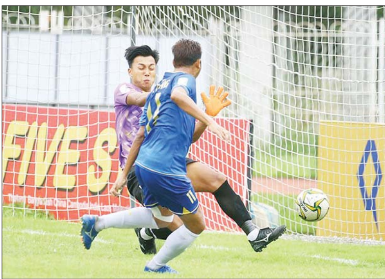
ရတနာပုံအသင်းအတွက် ပထမဂိုးကို သက်နိုင် သွင်းယူနေစဉ်။

ရန်ကုန် ဩဂုတ် ၂၅ ၂၀၂၂ ရာသီ MNL အမှတ်ပေးပြိုင်ပွဲ ပွဲစဉ် (၉) နောက်ဆုံးနေ့အဖြစ် ရတနာပုံအသင်းနှင့် အား/ကာ သိပ္ပံအသင်းတို့ ဩဂုတ် ၂၅ ရက် က သုဝဏ္ဏကွင်း၌ ယှဉ်ပြိုင်ကစား ရာ ရတနာပုံအသင်းက သုံးဂိုး-တစ်ဂိုးဖြင့် အနိုင်ရခဲ့သည်။ ပထမအကျော့ ပြီးဆုံးခါနီး တွင် နိုင်ပွဲဆက်ခဲ့သည့် ရတနာပုံ အသင်းသည် ယခုပွဲတွင်လည်း အား/ကာသိပ္ပံကို အနိုင်ယူပြီး အဆင့် ၄ နေရာအထိ တက်လှမ်း နိုင်ခဲ့သည်။ ရတနာပုံအသင်း သည် ကစားအားကောင်းသည့် စာမျက်နှာ ၁၃ ကော်လံ ၁ ၀