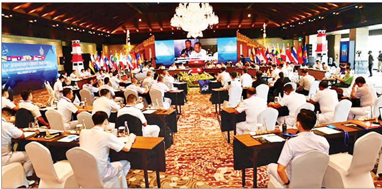
(၁၆)ကြိမ်မြောက် အာဆီယံရေတပ်ဦးစီးချုပ်များ အစည်းအဝေး (16 th ASEAN Navy Chiefs' Meeting-16 th ANCM) ကျင်းပစဉ်။

နေပြည်တော် ဩဂုတ် ၂၅ အင်ဒိုနီးရှားနိုင်ငံတွင် ကျင်းပပြုလုပ်ခဲ့သည့် (၁၆)ကြိမ်မြောက် အာဆီယံ ရေတပ်ဦးစီးချုပ်များ အစည်းအဝေး (16 th ASEAN Navy Chiefs' Meeting-16 th ANCM) သို့ တက်ရောက်ခဲ့သည့် ကာကွယ်ရေးဦးစီးချုပ်(ရေ) ဗိုလ်ချုပ်ကြီး မိုးအောင် ဦးဆောင်သော ကိုယ်စားလှယ်အဖွဲ့သည် ယနေ့ညနေပိုင်းတွင် ရန်ကုန်မြို့သို့ လေကြောင်းခရီးဖြင့် ပြန်လည်ရောက်ရှိလာရာ ရန်ကုန်တိုင်းစစ်ဌာနချုပ် တိုင်းမှူး ဗိုလ်ချုပ်ညွှန်ကြားရေးမှူးချုပ် အဖွဲ့ဝင်များက ရန်ကုန်အပြည်ပြည်ဆိုင်ရာ လေဆိပ်၌ ကြိုဆိုနှုတ်ဆက်ကြသည်။