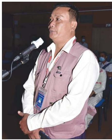
ဦးဝင်းဦး NHP သတင်းဌာန

ဗိုလ်ချုပ် ဇော်မင်းထွန်း က မြန်မာနိုင်ငံသည် ရေနံထွက်သည့်နိုင်ငံဖြစ်သည်ဆိုလျှင် ဈေးနှုန်းသတ်မှတ်ပြီးရောင်းချကာ တည်ငြိမ်အောင် ဆောင်ရွက်နိုင်မည်ဖြစ်ကြောင်း၊ မြန်မာနိုင်ငံသည် ရေနံဖူလုံစွာ မထွက်ရှိသည့် နိုင်ငံဖြစ်သည့်အတွက် အခြားနိုင်ငံများမှ ဝယ်ယူတင်သွင်းရကြောင်း၊ ထို့ကြောင့် အခြားနိုင်ငံများမှ တင်သွင်းနိုင်သည့် ဈေးနှုန်း၊ ရောင်းချနိုင်သည့် ဈေးနှုန်းအတိုင်း မိမိတို့ ဝယ်ယူရခြင်းဖြစ်ကြောင်း၊ ကမ္ဘာ့ရေနံဈေးနှုန်း မြင့်တက်လျှင် မြန်မာ့ရေနံဈေးနှုန်းလည်း မြင့်တက်လာမည်ဖြစ်ကြောင်း၊ အစိုးရအနေဖြင့် လုပ်ဆောင်ပေးနိုင်သည့် အချက်အချာချက်သာရှိကြောင်း၊ နံပါတ်တစ်အချက်အနေဖြင့် စက်သုံးဆီနှင့်ပတ်သက်လာလျှင် အခွန်အခ လျှော့ပေါ့ကောက်ခံရန်ဖြစ်ပြီး မိမိတို့အနေဖြင့် အခွန်အခကို အစွမ်းကုန်လျှော့ချ၍ ကောက်ခံကြောင်း၊ နံပါတ်နှစ်အနေဖြင့် စက်သုံးဆီနှင့် ပတ်သက်လာလျှင် လိုအပ်သည့်နိုင်ငံခြားငွေကို ရောင်းချပေးရန်ဖြစ်ပြီး ယင်းကိုလည်း မိမိတို့ ဆောင်ရွက်လျက်ရှိကြောင်း၊ နိုင်ငံခြားငွေဆိုသည်မှာလည်း အလွယ်ရောင်း၍ မရကြောင်း၊ မိမိတို့နှင့် အိမ်နီးချင်းနိုင်ငံတစ်နိုင်ငံဆိုလျှင် စက်သုံးဆီနှင့် ပတ်သက်ပြီး ပြဿနာဖြစ်မည်စိုးသဖြင့် အစိုးရအနေဖြင့် ၎င်း၏အရန်ငွေထဲမှ အရောင်းအဝယ် လုပ်ပေးရာ အရန်ငွေသည် တောင့်ခံနိုင်သည့် အနေအထား မရှိတော့သည့်အခြေအနေအထိ ဖြစ်ရကြောင်း၊ ထိုအခါ စက်သုံးဆီဈေးနှုန်းကို လွှတ်ပေးလိုက်သည့်အတွက် စက်သုံးဆီဈေးနှုန်းသည်