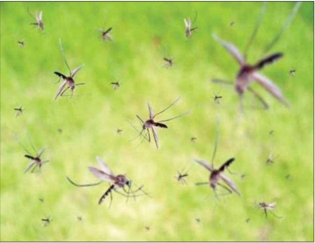
ထားသည်။ သွေးလွန်တုပ်ကွေး ရောဂါ မြို့တော် ဗီယန်ကျင်းတွင် ကူးစက်မှု အမြင့်ဆုံးဖြစ်ပြီး ကူးစက်ဖြစ်ပွားသူ ၁၀၀၉၀ ရှိရာ လွန်ဆုံးသောမြို့တွင် ကူးစက်သူ

လာအို ကျန်းမာရေးဝန်ကြီးဌာနလက်အောက်ရှိ သတင်းအချက်အလက်နှင့် ပညာရေးစင်တာမှ ထုတ်ပြန်သော အစီရင်ခံစာတွင် နိုင်ငံအတွင်း သွေးလွန်တုပ်ကွေးရောဂါ ထပ်မံဖြစ်ပွားသူ ၂၂၄ ဦးရှိပြီး စုစုပေါင်း ကူးစက်ခံရသူ ၂၀၀၃၅ ဦးနှင့် သေဆုံးသူ ၁၇ ဦးရှိကြောင်း မှတ်တမ်းတင်