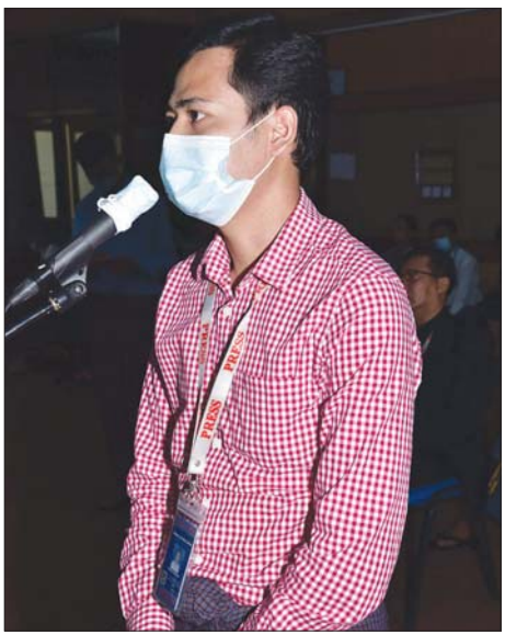
ဦးတွင်ထူးအောင် One News Channel

ဗိုလ်ချုပ် ဇော်မင်းထွန်း က ဆီဝယ်ယူမှုနှင့် ပတ်သက်ပြီး ၂၀၂၂ ခုနှစ် ဩဂုတ် ၁၅ ရက်တွင် ကြေညာချက်ထုတ်ခဲ့သည်ကို တွေ့ရှိရကြောင်း၊ မသမာမှုများတွေ့ရှိပါက ကြေညာချက်ပါအတိုင်း ထိုနေရာများသို့ တိုင်ကြားနိုင်ကြောင်း၊ စက်သုံးဆီနှင့်ပတ်သက်လျှင် ရှေးမှ တင်သွင်းခွင့်ရပြီးဖြစ်ကြောင်း၊ ထို့ပြင် တင်သွင်းခွင့်ရသည်များကို မှန်မှန် ကန်ကန်ဖြစ်အောင် ဆက်လက်ဆောင်ရွက်သွားမည်ဖြစ်ကြောင်း၊ နယ်များသို့ရောက်အောင် ပို့ဆောင်ရာတွင် နယ်ဈေးနှုန်းနှင့် ရန်ကုန်ဈေးနှုန်းတူစရာအကြောင်းမရှိပါကြောင်း၊ စက်သုံးဆီသည် ဆိပ်ကမ်းရှိရာ ရန်ကုန်သို့သာ ရောက်ရှိကြောင်း၊ နယ်များတွင်မူ ရန်ကုန်ဈေးနှုန်းထက် သယ်ယူပို့ဆောင်စရိတ် အနည်းငယ်ပို၍ ကြီးမြင့်နေမည်ဖြစ်ကြောင်း၊ တချို့သော ဆိုင်ငယ်လေးများ၊ ဆိုင်များသည် တက်ဈေးကိုမျှော်၍ လုပ်ဆောင်နေသည်များလည်းရှိကြောင်း၊ တချို့မှာလည်း တက်ဈေးကို မျှော်ခြင်းမဟုတ်ဘဲ ရိုးရိုးသားသား ဖြစ်ခြင်းဖြစ်ကြောင်း၊ မီဒီယာများကိုလည်း မိမိပြောပြီးဖြစ်ကြောင်း၊ မန္တလေး၌ ကောလာဟလများကြောင့် ဆီဆိုင်များတွင် စုပြုံ၍ဝယ်လိုက်ကြကြောင်း၊ အရန်ဆီထဲက မဖြည့်နိုင်ခင် ပြတ်လပ်