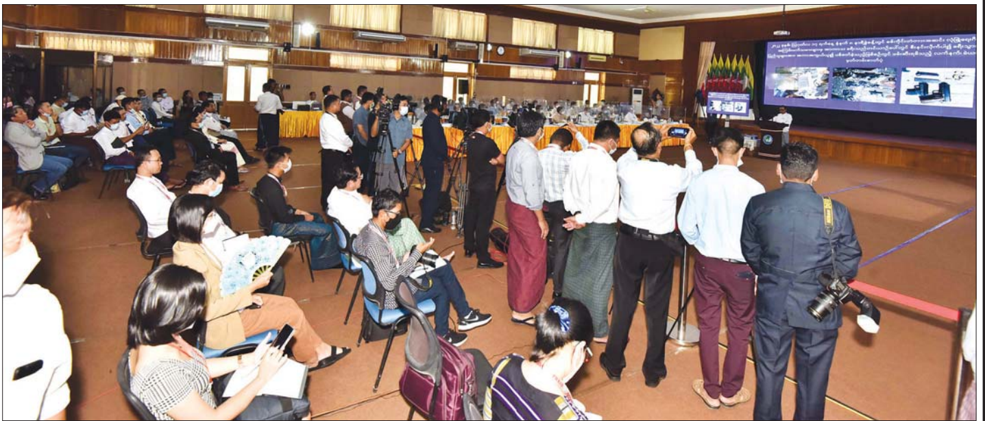
နိုင်ငံတော်စီမံအုပ်ချုပ်ရေးကောင်စီ၊ သတင်းထုတ်ပြန်ရေးအဖွဲ့၏ (၁၉) ကြိမ်မြောက် သတင်းစာရှင်းလင်းပွဲ၌ သတင်းထောက်များနှင့် သတင်းမီဒီယာသမားများက သတင်းမှတ်တမ်းဓာတ်ပုံရယူစဉ်။

ဗဟိုဘဏ်မှ ကင်းလွတ်ခွင့်ပေးထားသည့် လုပ်ငန်းတချို့၌ မိမိတို့တွေ့ရသည့်လုပ်ငန်းခြောက်ခုခန့်ရှိကြောင်း၊ ယင်းလုပ်ငန်းအပေါ် ဝင်လာသည့် ဒေါ်လာပမာဏက အနည်းငယ်သာရှိသည်ဟု သိရကြောင်း၊ စက်ရုံများ၊ ကုမ္ပဏီများ လည်ပတ်ရန်အတွက် Import လုပ်ရသည့်အခါတွင် OTD ကတစ်ဆင့် ဗဟိုဘဏ်က သတ်မှတ်ထားသည့် သတ်မှတ်နှုန်းထားဖြင့် တစ်ဒေါ်လာကို ၈၀၀ ကျပ်၊ ၉၀၀ ကျပ်၊ ၁၀၀၀ ကျပ် ယင်းကဲ့သို့ ကွာဟချက်များဖြင့် ဝယ်ပြီး လုပ်ရသလိုများ ဖြစ်လာကြောင်း၊ ထို့ပြင် ကုန်ကြမ်း Import လုပ်ရန်အတွက် ဒေါ်လာဝယ်ယူရန်အတွက်ကလည်း ပြင်ပတွင် မဖြစ်နိုင်လောက်သည့် အနေအထားအထိကို ဖြစ်လာကြောင်း၊ ဒေါ်လာအကောင့်များကနေပြီး ဗဟိုဘဏ်က သတ်မှတ်ထားသည့်နှုန်းထားဖြင့် ငွေလဲလှယ်ခံလိုက်ရသကဲ့သို့ ယင်းငွေများမှတစ်ဆင့် ပြည်တွင်းတွင် နိုင်ငံခြားငွေများ၊ အိမ်ခြံမြေများ၊ ကားများ ယင်းတို့ကိုဝယ်သည့် အနေအထားဖြစ်လာကြောင်း၊ ဈေးကစားသည့်သူများကြောင့်လည်း ပုံမှန်မဟုတ်ဘဲ နှုန်းထားများထိုးတက်လာသည့် အနေအထားအထိ ဖြစ်လာကြောင်း၊ ဈေးကွက်ကလည်း ကမောက်ကမဖြစ်ပြီး တိုင်းပြည်စီးပွားရေးသည် ယင်းအခြေအနေအတွင်းတွင် ထိခိုက်ရသည့် အနေအထား ဖြစ်လာကြောင်း။