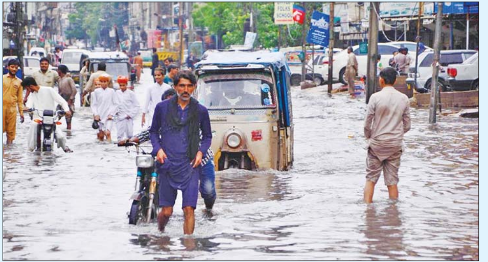
ပါကစ္စတန်နိုင်ငံ တောင်ပိုင်း ဟိုက်ဒရာဘတ်၌ ဩဂုတ် ၂၃ ရက်က ရေကြီးရေလျှံဖြစ်ပွားနေသည်ကို တွေ့ရစဉ်။

ထို့အပြင် အနောက်မြောက်ပိုင်း ခေဘာပျက်ခံသွန်ခွာပြည်နယ်တွင် သေဆုံးသူ ၁၆၉ ဦးနှင့်