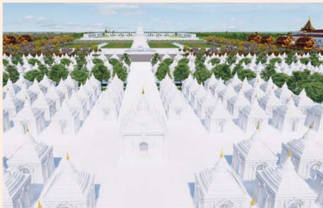
ကျောက်စာရုံစေတီ(၁၂ x ၁၂ x ၁၈)ပေ ၁ ဆူ တန်ဖိုး- ၂၇၉ သိန်း