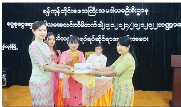
ရန်ကုန်တိုင်းဒေသကြီး သမဝါယမဦးစီးဌာန ငွေစုငွေချေး ဝိယမအသင်းလီမိတက်၏ ၂၀၂၀-၂၀၂၁/ ၂၀၂၁-၂၀၂၂ ဘဏ္ဍာရေးနှစ် နှစ်ပတ်လည်အရပ်ရပ်ဆိုင်ရာ အစည်းအဝေး အမှုဆောင်အစီရင်ခံစာနှင့် အသင်းစာရင်းစစ် အစီရင်ခံစာ ပြုခွဲပြီး အသင်းသားများသို့ စုဆောင်းငွေပေါ် အတိုးကျပ် ၃၈ ဒသမ ၉၁ သိန်းနှင့် အသင်းသား

ရန်ကုန် ဩဂုတ် ၂၄ ရန်ကုန်တိုင်းဒေသကြီး သမဝါယမဦးစီးဌာန ငွေစုငွေချေး သမဝါယမအသင်းလီမိတက်၏ ၂၀၂၀-၂၀၂၁/ ၂၀၂၁-၂၀၂၂ ဘဏ္ဍာရေးနှစ် နှစ်ပတ်လည်အရပ်ရပ်ဆိုင်ရာ အစည်းအဝေးကို ဩဂုတ် ၂၃ ရက်က ရန်ကုန်တိုင်းဒေသကြီး သမဝါယမဦးစီးဌာန အစည်းအဝေးခန်းမ၌ ကျင်းပသည်။ အဆိုပါ အစည်းအဝေးတွင် အသင်းစာရင်းစစ် အစီရင်ခံစာ အသင်း၏ ဘဏ္ဍာရေးရှင်းတမ်း