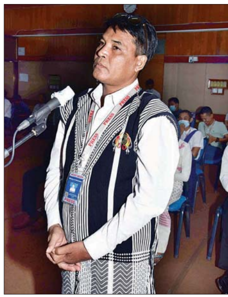
ဇော်မင်းဦး တွဲပြောသတင်းဌာန

ပြန်ဖွင့်သည့်အချိန်တွင် ကန့်ကွက်သူများရှိသကဲ့သို့ တပ်မတော်မှ ဆရာဝန်/ ဆရာမများ လာရောက်ချိန် တွင် ဝမ်းမြောက်စွာ ကြိုဆိုကြကြောင်း၊ တော်တော် ထူးခြားသည့်ဆေးရုံဖြစ်ကြောင်း၊ တချို့သောနေရာ များတွင် ဆရာဝန်/ဆရာမအခက်အခဲများရှိနေသော ကြောင့် တပ်မတော်မှ ဆရာဝန်/ ဆရာမများဖြင့် ကုသပေးနေကြောင်း၊ ဆေးဝါးကိစ္စများ လိုအပ်ချက် များကို ယခုသတင်းစာရှင်းလင်းပွဲပြီးပါက ကျန်းမာ ရေးဝန်ကြီးဌာနမှ တာဝန်ရှိသူ ကိုယ်စားလှယ်အား အချက်အလက်များ အသေးစိတ်ပေးစေလိုကြောင်း၊ မိမိတို့အစိုးရ ဝန်ကြီးဌာနအနေဖြင့် ဆက်လက် ကူညီဆောင်ရွက်ပေးသွားမည်ဖြစ်ကြောင်း။