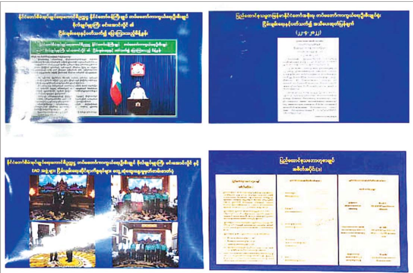
နိုင်ငံတော်စီမံအုပ်ချုပ်ရေးကောင်စီ၏ ငြိမ်းချမ်းရေးဆောင်ရွက်မှုများ မှတ်တမ်းဓာတ်ပုံ။

အခြားတစ်ခုမှာ ဘက်စုံမျှော်တိုးမှုဖြစ်ကြောင်း၊ ယခင်က တချို့ EAO အဖွဲ့များသည် နောက်ကွယ်မှ အားပေးထောက်ခံမှုဖြစ်သည့် ပြည်ပ၏ အားပေးထောက်ခံမှုမရှိသည့်အချိန်များတွင် လေသံများ ပြောင်းလဲသွားကြသည်ကို တွေ့ရကြောင်း၊ ယခုအချိန်ကဲ့သို့ ဝိုင်းဝန်းထောက်ပံ့သည့် အချိန်များတွင် လေသံများတစ်မျိုးဖြစ်လာကြကြောင်း၊ KNU အဖွဲ့အတွင်း၌ပင် KNU ကို စိတ်မချလို့ဟုဆို၍ ကော်သုလေး Army ဆိုသည့်အဖွဲ့ကို ဖွဲ့စည်းတည်ထောင်လိုက်သည်ကို အားလုံးအသိပင်ဖြစ်ကြောင်း၊ ၎င်းတို့ ပြောနေသည့်စကားများကို သတင်းထောက်ကြီးတို့လည်း အမြင်ပင် ဖြစ်ကြောင်း၊ တိုက်ပွဲများတွင်လည်း ထိုကဲ့သို့ပင်ဖြစ်ကြောင်း၊ ပွင့်ပွင့်လင်းလင်းပြောရမည်ဆိုပါက နောက်ဆုံးလာခဲ့သည့် SSPP အဖွဲ့က မိမိတို့နှင့် လာရောက်ဆွေးနွေးနေသည့်အချိန်၌ SSPP အဖွဲ့မှ အလယ်အလတ်အရာရှိ အဆင့်ရှိသူ တစ်ဦးက နိုင်ငံခြားသတင်းဌာနများကို ဆက်သွယ်၍ ၎င်း၏အင်တာဗျူးကိုထည့်ပေးရန် ကမ်းလှမ်းခဲ့ကြောင်း၊ ၎င်း၏အင်တာဗျူးသည် ငြိမ်းချမ်းရေးဆွေးနွေးပွဲသို့ သွားရောက်နေသည့်အဖွဲ့သည် SSPP