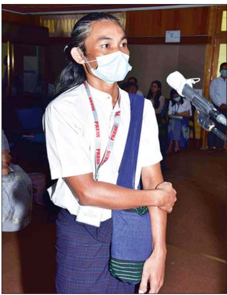
နောင်တော်လေး Myanmar National Post သတင်းဌာန

နောက်တစ်ချက်အနေဖြင့် သာစည်မြို့နယ် ဟန်ဇားတိုက်နယ်ဆေးရုံသည် နီပိန်းများ၊ NLD အစွန်းရောက်များလှုံ့ဆော်၍ CDM ပြုလုပ်သော ကြောင့် ရွာသူ/သားများက CDM ပြုလုပ် သူများကို