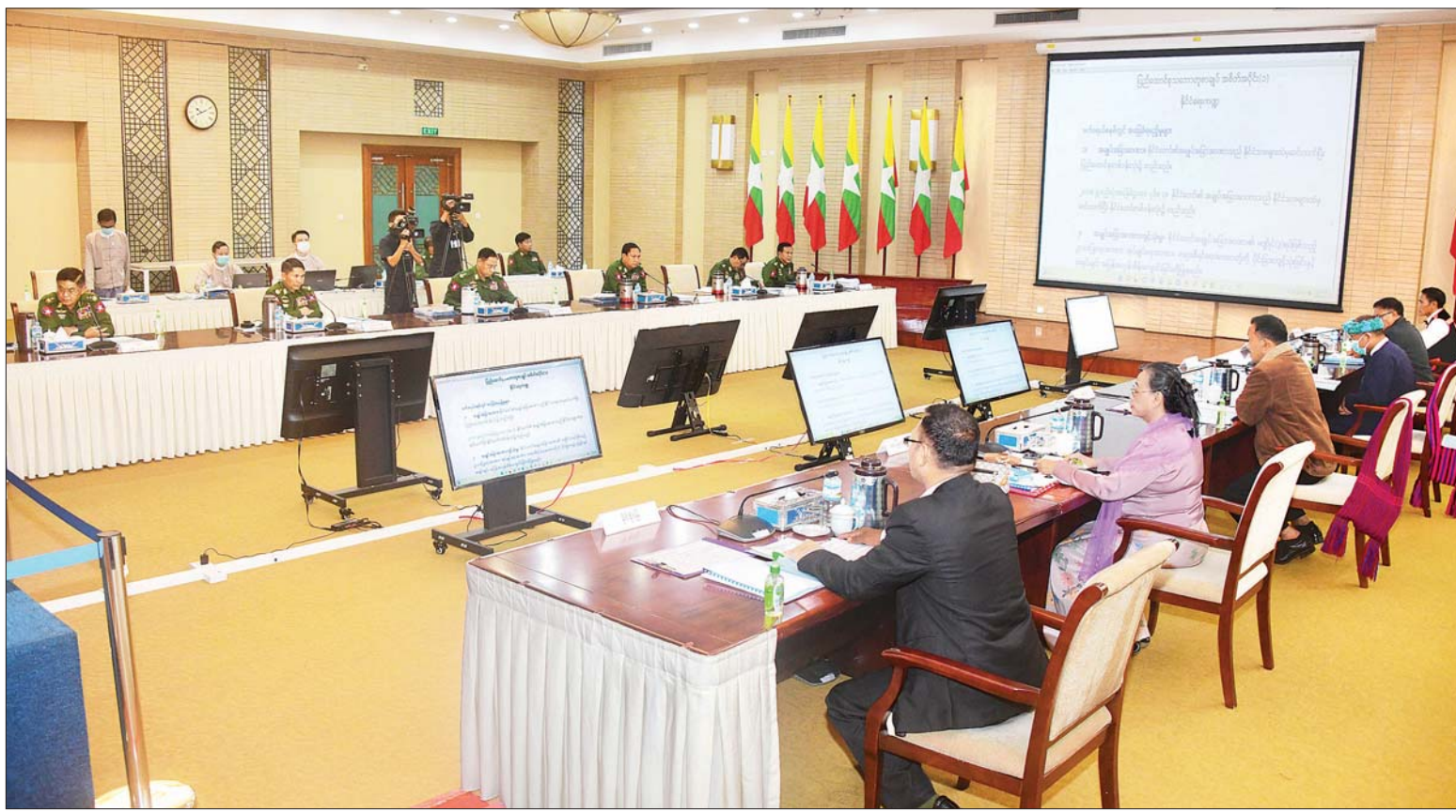
နိုင်ငံတော်၏ငြိမ်းချမ်းရေးဆွေးနွေးရေးအဖွဲ့နှင့် ပအိုဝ်းအမျိုးသားလွတ်မြောက်ရေးအဖွဲ့ချုပ်(PNLO) ဥက္ကဋ္ဌ၊ လားဟူဒီမိုကရက်တစ်အစည်းအရုံး(LDU) ဥက္ကဋ္ဌ၊ ရခိုင်ပြည်လွတ်မြောက်ရေးပါတီ(ALP) ဒုတိယဥက္ကဋ္ဌတို့ ဦးဆောင်သော ငြိမ်းချမ်းရေးကိုယ်စားလှယ်အဖွဲ့ ဒုတိယနေ့ တွေ့ဆုံဆွေးနွေးစဉ်။

ယနေ့ ဖတ်စရာ ကလိမ်စေ့ငြိမ်းဆင်၊ ဘုရားပြီးငြိမ်းဖျက် မဖြစ်စေလိုပါ ဆောင်းပါး စာ - ၆ ..... နိုင်ငံတော် စီမံအုပ်ချုပ်ရေးကောင်စီ လက်ထက်တွင် ဝန်ထမ်းများ သက်သာချောင်ချိရေးအတွက် ချီးမြှင့်ပေးမှုများ ဆောင်းပါး စာ - ၈ ..... လောကကို သိပ္ပံပညာ၊ နည်းပညာများဖြင့် အလှဆင်ကြရာတွင်... ဆောင်းပါး စာ - ၁၀