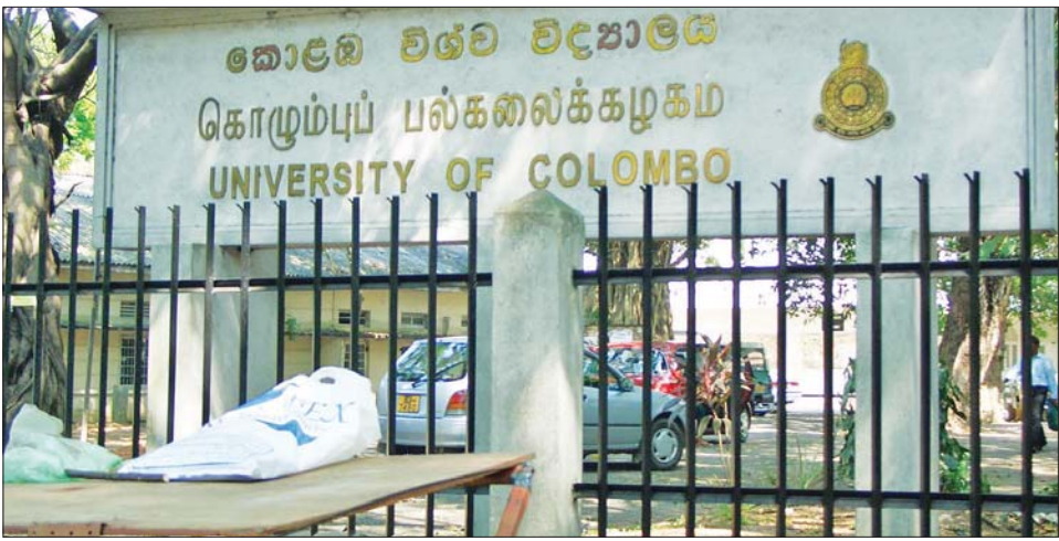
သီရိလင်္ကာနိုင်ငံ၏ ထိပ်တန်းတက္ကသိုလ်တစ်ခုဖြစ်သည့် ကိုလံဘိုတက္ကသိုလ် မှခန်းဆင်းဘုတ်ကို တွေ့ရစဉ်။

ကိုလံဘို ဩဂုတ် ၂၃ သီရိလင်္ကာတက္ကသိုလ် ခွင့်ပြုချက် ကော်မရှင် (ယူဂျီစီ)က နိုင်ငံတွင်း ရှိ တက္ကသိုလ်များအားလုံးကို စက်တင်ဘာလတွင် ဖွင့်လှစ်မည် ဖြစ်ကြောင်း ဩဂုတ် ၂၃ ရက်က ကြေညာခဲ့သည်။