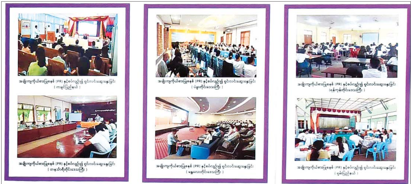
အချိုးကျကိုယ်စားပြုစနစ် (PR) နှင့်စပ်လျဉ်း၍ ဆွေးနွေးခြင်း မှတ်တမ်းဓာတ်ပုံ။