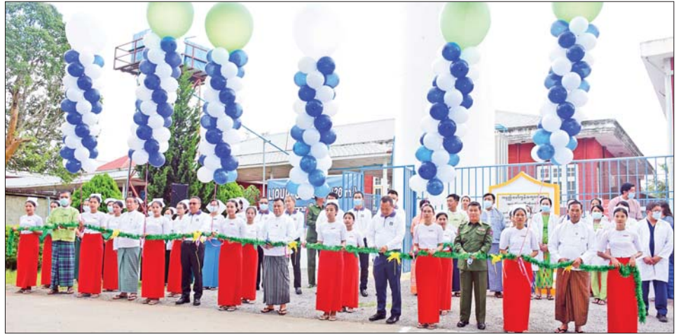
လိုက်လံကြည့်ရှုကာ လူနာများအား ရင်းနှီးစွာ များ၊ ဝန်ထမ်းများနှင့်တွေ့ဆုံကာ လိုအပ်သည်များ နှုတ်ဆက်အားပေးသည်။ ယင်းနောက် တိုင်းဒေသကြီးဝန်ကြီးချုပ်နှင့် ငွေကျပ် ၁၀ သိန်းကို ပေးအပ်ကြောင်း သိရသည်။ အဖွဲ့သည် ဆေးရုံအုပ်ကြီး၊ ဆရာဝန်များ၊ သူနာပြု သတင်းစဉ်

အထောက်အကူပြု ရန်ပုံငွေရှာဖွေရေးကော်မတီ အဖွဲ့သို့ ဂုဏ်ပြုမှတ်တမ်းလွှာကိုလည်းကောင်း၊ ပြည်သူ့ကျန်းမာရေးနှင့် မြို့ပြဖွံ့ဖြိုးတိုးတက်ရေး အထောက်အကူပြု ရန်ပုံငွေရှာဖွေရေးကော်မတီမှ တာဝန်ရှိသူများက စက်နှင့် ပတ်သက်သည့် စာရွက် စာတမ်းများကို ဆေးရုံအုပ်ကြီးထံသို့လည်းကောင်း ပေးအပ်သည်။ ကိုဗစ်-၁၉ လူနာများနှင့် အောက်ဆီဂျင် လိုအပ် သော အခြားလူနာများ အသုံးပြုရာတွင် လွယ်လင့် တကူ အဆင်ပြေစေရန် Liquid Oxygen မှ Vapourizer ခံ၍ Gaseous Oxygen သို့ ပြောင်းပေး သော စနစ်ဖြစ်ပြီး စက်တစ်စုံ၏တန်ဖိုး ငွေကျပ် ၁၉၄ သန်းဖြင့် ဆောက်လုပ်တပ်ဆင်လှူဒါန်းခြင်း ဖြစ်သည်။ ဆက်လက်၍ ဝန်ကြီးချုပ်နှင့်အဖွဲ့သည် Liquid Oxygen Storage Tank မှ အောက်ဆီဂျင်ရယူ၍ လူနာများအသုံးပြုနိုင်အောင် ဆောင်ရွက်ထားရှိမှုကို