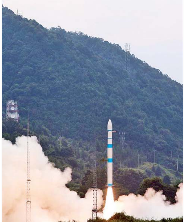
Chuangxin-16 ဂြိုဟ်တုကို သယ်ဆောင်ရေးခုံးပျံ Kuaizhou-1A ဖြင့် လွှတ်တင်မှုကို တွေ့ရစဉ်။

အဆိုပါ ဂြိုဟ်တုလွှတ်တင်မှုသည် သယ်ဆောင်ရေးခုံးပျံ Kuaizhou-1A များ၏ (၁၆) ကြိမ်မြောက် လွှတ်တင်မှုဖြစ်ကြောင်း သိရသည်။ ဆင်ဟွာ