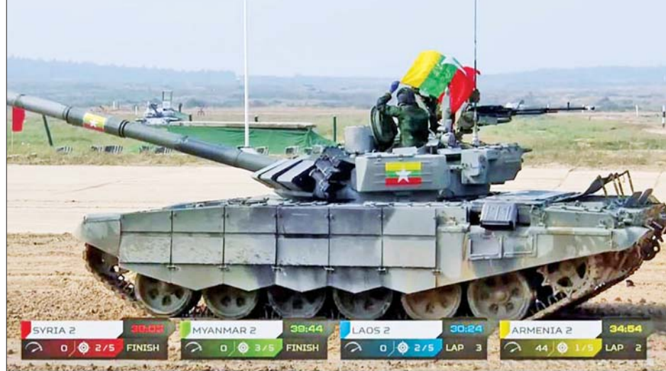
မြန်မာ့တပ်မတော် တင့်တပ်ဖွဲ့ တင့်ကားမောင်းနှင် ပစ်ခတ်ပြိုင်ပွဲ ဝင်နေစဉ်။

မြန်မာ့တပ်မတော်တင့်တပ်ဖွဲ့အနေဖြင့် (Tank