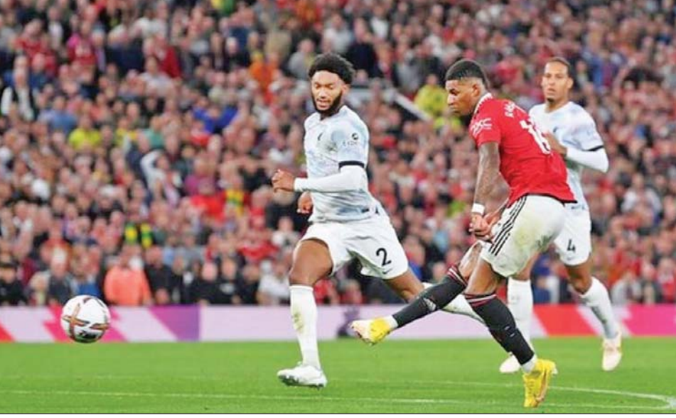
မန်ယူမှ ရက်ဖွဲ့ခွဲ လီဗာပူးအသင်းဘက်သို့ ဒုတိယဂိုးသွင်းယူစဉ်။

ပရီမီယာလိဂ် ပွဲစဉ် (၃) မှ အကောင်းဆုံး ပွဲစဉ်တစ်ပွဲဖြစ်သည့် မန်ယူအသင်းနှင့် ခါးသီးပြိုင်ဘက် လီဗာပူးအသင်းတို့ ပွဲစဉ်ကို ဩဂုတ် ၂၃ ရက် နံနက်ပိုင်းက အိုးထရက်ဖွဲ့ခွဲကွင်း၌ အကြိတ်အနယ် ယှဉ်ပြိုင်ကစားခဲ့ရာ မန်ယူအသင်းက နှစ်ရိုး-တစ်ရိုးအဖြင့် အနိုင်ရရှိခဲ့သည်။ အဆိုပါနိုင်ပွဲသည် နည်းပြသစ် တန်ဟတ်အတွက် ပထမဆုံး ပရီမီယာလိဂ်နိုင်ပွဲကို ရရှိခြင်းဖြစ်သည်။ ပွဲစဉ်မစတင်မီတွင် မန်ယူအသင်းသည် ရိုးရဲမက်ဒရစ်အသင်းမှ ခေါ်ယူထားသည့် စာမျက်နှာ ၁၂ ကော်လံ ၁ ●