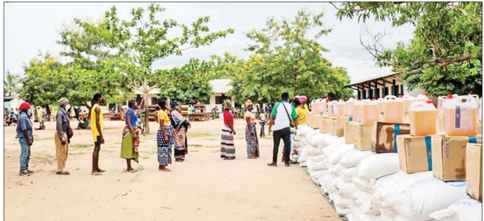
မိုဇမ်ဘစ်နိုင်ငံမြောက်ပိုင်းတွင် ကုလသမဂ္ဂ ကမ္ဘာ့စားနပ်ရိက္ခာအစီအစဉ်မှ ဖြန့်ဝေပေးသော စားနပ်ရိက္ခာများကို ရရှိရန် တန်းစီစောင့်ဆိုင်းနေသူများကို တွေ့ရစဉ်။

သည် အခြေအနေကို သတိထား စောင့်ကြည့်လျက် ရှိကြောင်း သတင်းထောက်များကိုပြောကြား လိုက်သည်။ ကာဘိုဒယ်ဂါတိုတွင် ဖြစ်ပွား သော လက်နက်ကိုင်ပဋိပက္ခများ