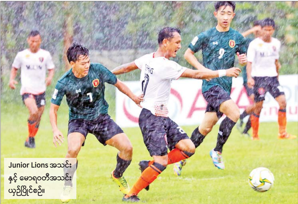
Junior Lions အသင်း နှင့် မောရဝတီအသင်း ယှဉ်ပြိုင်စဉ်။