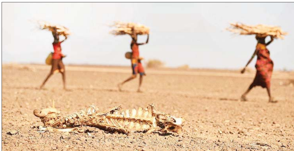
ကင်ညာနိုင်ငံမြောက်ပိုင်း အဆိုးရွားဆုံး မိုးခေါင်ရေရှားမှုဒေသ၌ သေဆုံးနေသည့် နွားတစ်ကောင်ရုပ်ကြွင်းနှင့် ထင်းသယ်လာသည့် အမျိုးသမီးများကို တွေ့ရစဉ်။

နိုင်ရိုဘီ၊ ဩဂုတ် ၂၂ - နိုင်ငံအနှံ့အပြားတွင် မိုးခေါင် ရေရှားမှုအခြေအနေ ပိုမိုဆိုးရွားလာခြင်းကြောင့် စားနပ်ရိက္ခာမပူလုံမှုမရှိသည့် ကင်ညာနိုင်ငံသား အရေအတွက်သည် လက်ရှိ ၄ ဒသမ ၁ သန်းထက် အောက်တို့ ဘာလတွင် ၄ ဒသမ ၃၅ သန်း အထိရှိလာနိုင်သည်ဟု နိုင်ငံပိုင် အေဂျင်စီတစ်ခုက ဩဂုတ် ၂၁ ရက်တွင် ထုတ်ပြန်သည်။ အမျိုးသား မိုးခေါင်ရေရှားမှု စီမံခန့်ခွဲရေး အာဏာပိုင်အဖွဲ့ (အင်နီဒီအမ်အေ) ၏ အဆိုအရ မိုးနည်းရေရှား ဒေသများတွင် အဓိကအားဖြင့် ခရိုင် ၂၃ ခုသည် ရေမလုံလောက်မှု၊ ငတ်မွတ်မှုနှင့် အာဟာရချို့တဲ့မှုတို့ကို ပိုမိုဆိုးရွားစေသည့် ပြင်းထန်ခြောက်သွေ့သော အခြေအနေနှင့် ရင်ဆိုင်နေကြရသည်။ ကန္တာရ ကျိုင်းကောင်းများ ကျောက်ခြင်းနှင့် ကိုဗစ်-၁၉ ကူးစက်ရောဂါတို့နှင့်အတူ စတုတ္ထမြောက် မိုးရာသီအထိ ဆက်တိုက် မိုးခေါင်နေခြင်းတို့ကြောင့် စားနပ်ရိက္ခာမပူလုံမှု အခြေအနေမှာ ပိုမို