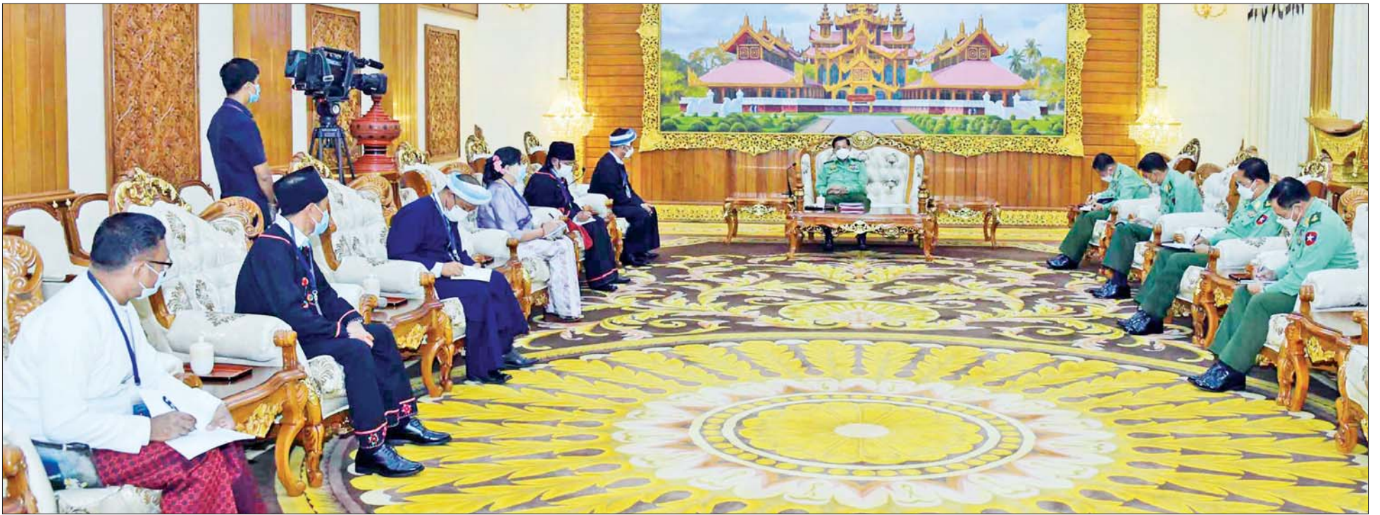
နိုင်ငံတော်စီမံအုပ်ချုပ်ရေးကောင်စီဥက္ကဋ္ဌ တပ်မတော်ကာကွယ်ရေးဦးစီးချုပ် ဗိုလ်ချုပ်မှူးကြီး မင်းအောင်လှိုင် ငြိမ်းချမ်းရေးကိုယ်စားလှယ်အဖွဲ့များနှင့် တွေ့ဆုံ၍ ငြိမ်းချမ်းရေးဆိုင်ရာကိစ္စရပ်များ ဆွေးနွေးစဉ်။