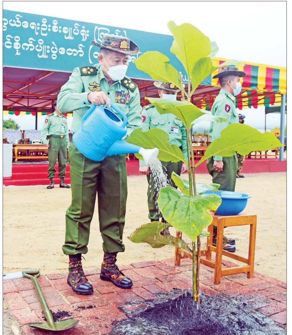
နိုင်ငံတော်စီမံအုပ်ချုပ်ရေးကောင်စီ ဒုတိယဥက္ကဋ္ဌ ဒုတိယတပ်မတော်ကာကွယ်ရေးဦးစီးချုပ် ကာကွယ်ရေးဦးစီးချုပ် (ကြည်း) ဒုတိယဗိုလ်ချုပ်မှူးကြီး စိုးဝင်း ကျွန်းပင်စိုက်ပျိုးပေးစဉ်။