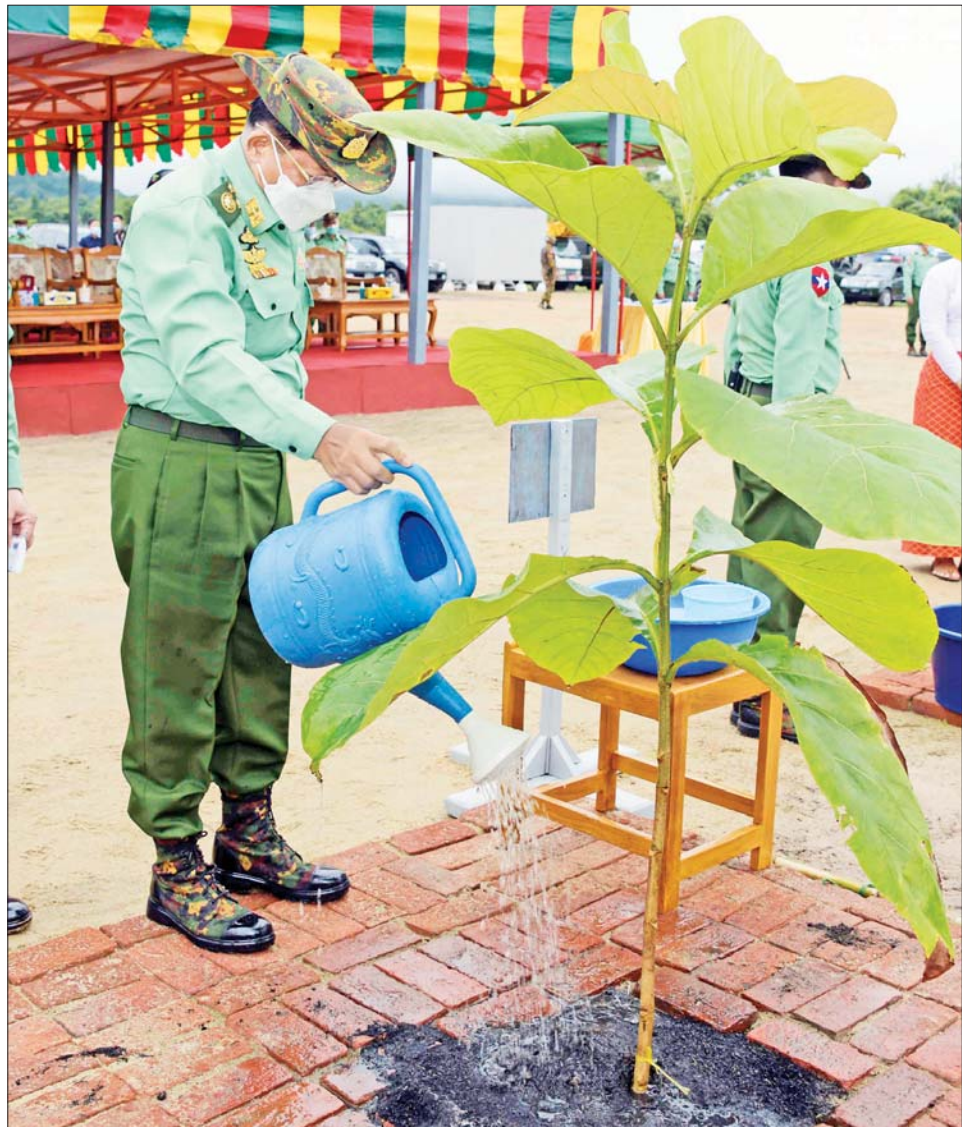
နိုင်ငံတော်စီမံအုပ်ချုပ်ရေးကောင်စီဥက္ကဋ္ဌ တပ်မတော်ကာကွယ်ရေးဦးစီးချုပ် ဗိုလ်ချုပ်မှူးကြီး မင်းအောင်လှိုင် ရတနာတန်းဝင် ကျွန်းပင်ကို ဦးဆောင်စိုက်ပျိုးပေးစဉ်။