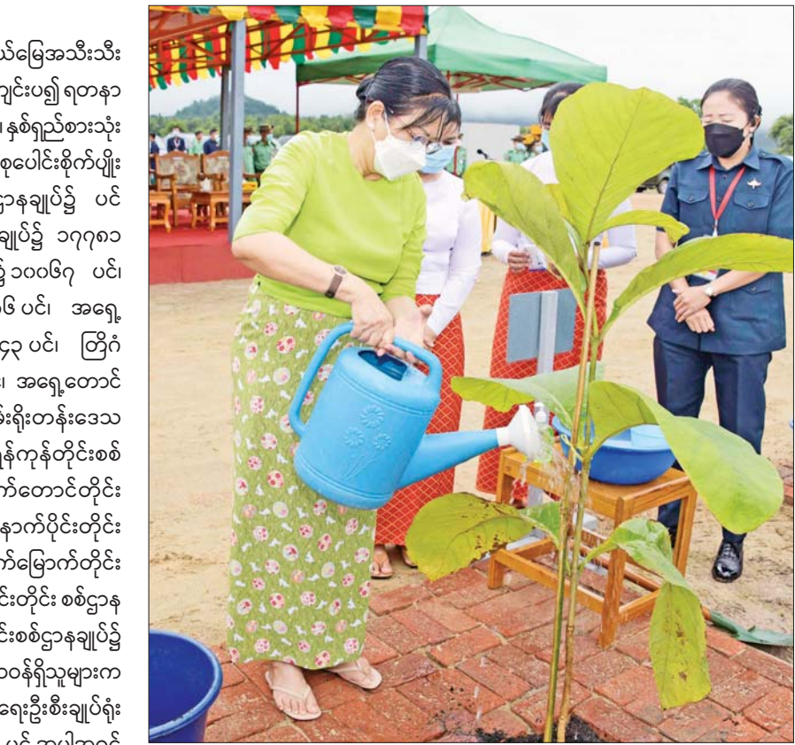
နိုင်ငံတော်စီမံအုပ်ချုပ်ရေးကောင်စီဥက္ကဋ္ဌ တပ်မတော်ကာကွယ်ရေးဦးစီးချုပ် ဗိုလ်ချုပ်မှူးကြီး မင်းအောင်လှိုင်၏ဇနီး ဒေါ်ကြူကြူလှ ရတနာတန်းဝင် ကျွန်းပင်ကို ဦးဆောင်စိုက်ပျိုးပေးစဉ်။

အလားတူ တိုင်းစစ်ဌာနချုပ် နယ်မြေအသီးသီး၌လည်း မိုးရာသီသစ်ပင်စိုက်ပွဲများ ကျင်းပ၍ ရတနာတန်းဝင်ပင်၊ စက်မှုကုန်ကြမ်းသီးနှံပင်၊ နှစ်ရှည်စားသုံးသီးနှံပင်၊ အရိပ်ရလေကာပင်များကို စုပေါင်းစိုက်ပျိုးကြရာတွင် နေပြည်တော်တိုင်းစစ်ဌာနချုပ်၌ ပင် ၂၁၅၅၀၊ မြောက်ပိုင်းတိုင်းစစ်ဌာနချုပ်၌ ၁၇၇၈၀ ပင်၊ အရှေ့မြောက်တိုင်းစစ်ဌာနချုပ်၌ ၁၀၀၆၇ ပင်၊ အရှေ့ပိုင်းတိုင်းစစ်ဌာနချုပ်၌ ၇၁၈၆ ပင်၊ အရှေ့အလယ်ပိုင်းတိုင်းစစ်ဌာနချုပ်၌ ၂၂၂၄၃ ပင်၊ တြိဂံဒေသတိုင်းစစ်ဌာနချုပ်၌ ၁၇၆၉၅ ပင်၊ အရှေ့တောင်တိုင်းစစ်ဌာနချုပ်၌ ၄၀၀၇ ပင်၊ ကမ်းရိုးတန်းဒေသတိုင်းစစ်ဌာနချုပ်၌ ၁၁၀၅၈ ပင်၊ ရန်ကုန်တိုင်းစစ်ဌာနချုပ်၌ ၁၈၂၄၈ ပင်၊ အနောက်တောင်တိုင်းစစ်ဌာနချုပ်၌ ၂၀၄၆၄ ပင်၊ အနောက်ပိုင်းတိုင်းစစ်ဌာနချုပ်၌ ၁၅၃၈၉ ပင်၊ အနောက်မြောက်တိုင်းစစ်ဌာနချုပ်၌ ပင် ၂၅၆၀၊ အလယ်ပိုင်းတိုင်းစစ်ဌာနချုပ်၌ ၂၉၈၃၄ ပင်နှင့် တောင်ပိုင်းတိုင်းစစ်ဌာနချုပ်၌ ၂၁၅၈၄ ပင်တို့ကို တိုင်းများနှင့် တာဝန်ရှိသူများက စုပေါင်းစိုက်ပျိုးခဲ့ကြပြီး ကာကွယ်ရေးဦးစီးချုပ်ရုံး (ကြည်း)ဝင်း၌ စိုက်ပျိုးသည့် ၄၃၀၄ ပင် အပါအဝင် တပ်မတော်တစ်ရပ်လုံးအနေဖြင့် ယနေ့တွင် စုစုပေါင်းသစ်ပင် ၂၃၀၆၇၀ ကို စိုက်ပျိုးခဲ့ကြကြောင်း သတင်းရရှိသည်။