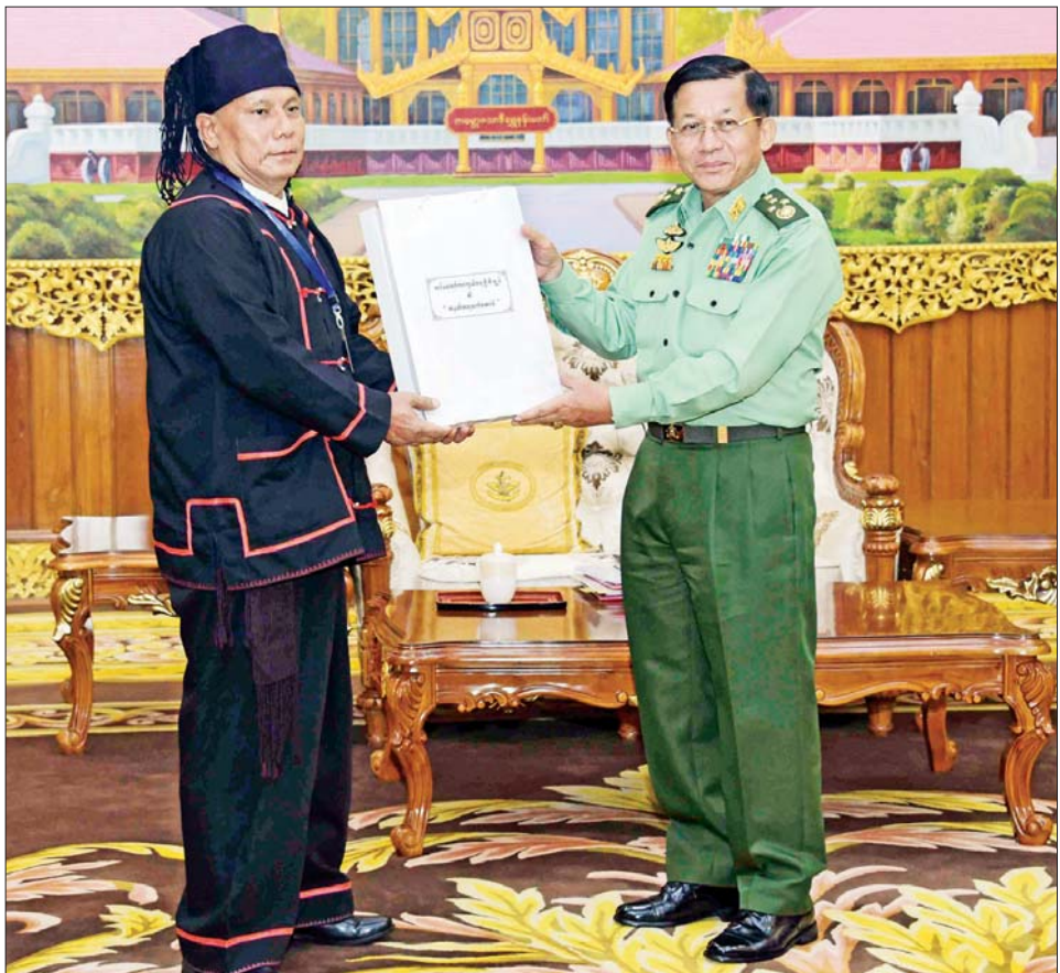
နိုင်ငံတော်စီမံအုပ်ချုပ်ရေးကောင်စီဥက္ကဋ္ဌ တပ်မတော်ကာကွယ်ရေးဦးစီးချုပ် ဗိုလ်ချုပ်မှူးကြီး မင်းအောင်လှိုင် လားဟူဒီမိုကရက်တစ် အစည်းအရုံး(LDU)ဥက္ကဋ္ဌ ကျာဆော်လမွန်အား အမှတ်တရ လက်ဆောင်ပစ္စည်း ပေးအပ်စဉ်။

အတွက် တိုင်းရင်းသားကိုယ်စား လှယ်များအနေဖြင့် နိုင်ငံရေး စင်မြင့်တွင် ယခုထက် ပိုမိုပါဝင် လာရန်လိုအပ်သည့် အခြေအနေ များ၊ ထိုသို့ အနာဂတ်တွင် တိုင်းရင်းသားများ နိုင်ငံရေးစင်မြင့် ပေါ်သို့ ရောက်ရှိလာစေရေး ကြိုတင်ပြင်ဆင်ဆောင်ရွက်သင့် သည့်များနှင့် နိုင်ငံတော်အစိုးရ အနေဖြင့် ကူညီဆောင်ရွက်ပေး နိုင်မည့် အခြေအနေများ၊ လွှတ်တော်အတွင်း တိုင်းရင်းသား များနှင့် လူထုလူတန်းစားအလွှာ များကို ကိုယ်စားပြုသူများ ကျယ်ပြန့်စွာပါဝင်လာရေး ဆောင် ရွက်ရာတွင် နိုင်ငံရေးပါတီ အမျိုး အစားအလိုက် ဆောင်ရွက်နိုင်မည့် အခြေအနေများ၊ အမိန့်ငံတော် တည်းဟူသော အရိပ်အာဝါသ အောက်တွင် အတူတကွပေါင်းစည်း နေထိုင်ကြသူများ ဖြစ်သဖြင့် ပြည်ထောင်စုဖွား တိုင်းရင်းသား များအနေဖြင့် နိုင်ငံတော်ဖွံ့ဖြိုး တိုးတက်ရေးအတွက် ဆိုပါက တစ်သွေးတစ်သားတည်း၊ တစ်စိတ် တစ်ဝမ်းတည်းဖြင့် စိတ်တူ ကိုယ်တူ သဘောထားတူညီစွာ အတူတကွလက်တွဲ၍ ကြိုးပမ်း ဆောင်ရွက်သွားရန် လိုအပ်သည့် အခြေအနေများ၊ ဖွဲ့စည်းပုံအခြေခံ ဥပဒေ(၂၀၀၈ ခုနှစ်) နှင့် တစ်နိုင်