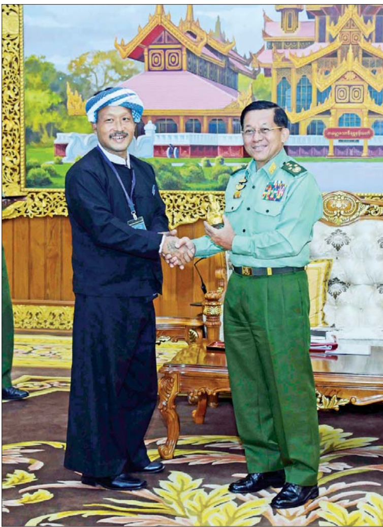
နိုင်ငံတော်စီမံအုပ်ချုပ်ရေးကောင်စီဥက္ကဋ္ဌ တပ်မတော်ကာကွယ်ရေးဦးစီးချုပ် ဗိုလ်ချုပ်မှူးကြီး မင်းအောင်လှိုင်ထံ ပအိုဝ်းအမျိုးသား လွတ်မြောက်ရေးအဖွဲ့ချုပ် (PNLO) ဥက္ကဋ္ဌ ခွန်သူရိန် လက်ဆောင်ပစ္စည်း ပေးအပ်စဉ်။

ထို့နောက် နိုင်ငံတော်စီမံအုပ်ချုပ်ရေးကောင်စီ ဥက္ကဋ္ဌ တပ်မတော်ကာကွယ်ရေးဦးစီးချုပ်က နိုင်ငံတော်စီမံအုပ်ချုပ်ရေးကောင်စီအနေဖြင့် နိုင်ငံတော်၏ တာဝန်များကို ထမ်းဆောင်နေချိန်အတွင်း တိုင်းရင်းသားဒေသများ ဖွံ့ဖြိုးတိုးတက်ရေးအတွက် ကြိုးပမ်းပြည့်ဆည်း ဆောင်ရွက်ပေးလျက်ရှိသည့် အခြေအနေများနှင့် တိုင်းရင်းသားဒေသများအနေဖြင့်လည်း ယင်းအခွင့်အရေးကို အမိအရ ရယူပြီး အပြည့်အဝအသုံးပြု၍ ဒေသဖွံ့ဖြိုးတိုးတက်ရေးကို ကြိုးပမ်းဆောင်ရွက်စေလိုသည့် အခြေအနေများ၊ နယ်မြေဒေသတစ်ခုတည်းနှင့် တိုင်းရင်းသားမျိုးနွယ်စု တစ်ခုတည်း၌ပင် မတူညီသည့် သဘောထားအမြင်နှင့် ရပ်တည်ချက်များ ရှိနိုင်မည်ဖြစ်သည့်အတွက် တူညီသော သဘောထားအမြင်များရရှိစေရေး ဆွေးနွေးအဖြေရှာ၍ ဒေသမှ တစ်ဆင့် တိုင်းပြည်ဖွံ့ဖြိုးတိုးတက်