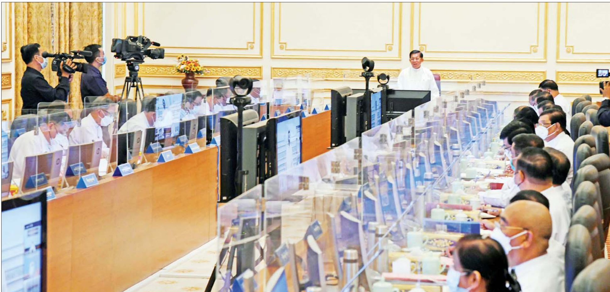
နိုင်ငံတော်စီမံအုပ်ချုပ်ရေးကောင်စီဥက္ကဋ္ဌ နိုင်ငံတော်ဝန်ကြီးချုပ် ဗိုလ်ချုပ်မှူးကြီး မင်းအောင်လှိုင် ပြည်ထောင်စုအစိုးရအဖွဲ့အစည်းအဝေး အမှတ်စဉ် (၆/၂၀၂၂) တွင် အမှာစကားပြောကြားစဉ်။

၄။ တစ်နိုင်ငံလုံး ထာဝရငြိမ်းချမ်းရေးရရှိရေးအတွက် တစ်နိုင်ငံလုံး ပစ်ခတ်တိုက်ခိုက်မှုရပ်စဲရေး သဘောတူစာချုပ် (NCA) ပါ သဘောတူညီချက်များအတိုင်း ဖြစ်နိုင်သမျှ အလေးထား လုပ်ဆောင်သွားမည်။ ၅။ အရေးပေါ်ကာလဆိုင်ရာ ပြဋ္ဌာန်းချက်များနှင့်အညီ ဆောင်ရွက်ပြီးစီးပါက ဖွဲ့စည်းပုံအခြေခံဥပဒေ (၂၀၀၈ ခုနှစ်)နှင့်အညီ လွတ်လပ်ပြီး တရားမျှတသော ပါတီစုံဒီမိုကရေစီ အထွေထွေရွေးကောက်ပွဲအား ပြန်လည်ကျင်းပ၍ အနိုင်ရသည့်ပါတီအား ဒီမိုကရေစီစံနှုန်းများနှင့်အညီ နိုင်ငံတော်တာဝန်အား လွှဲအပ်နိုင်ရေး ဆက်လက်ဆောင်ရွက်သွားမည်။