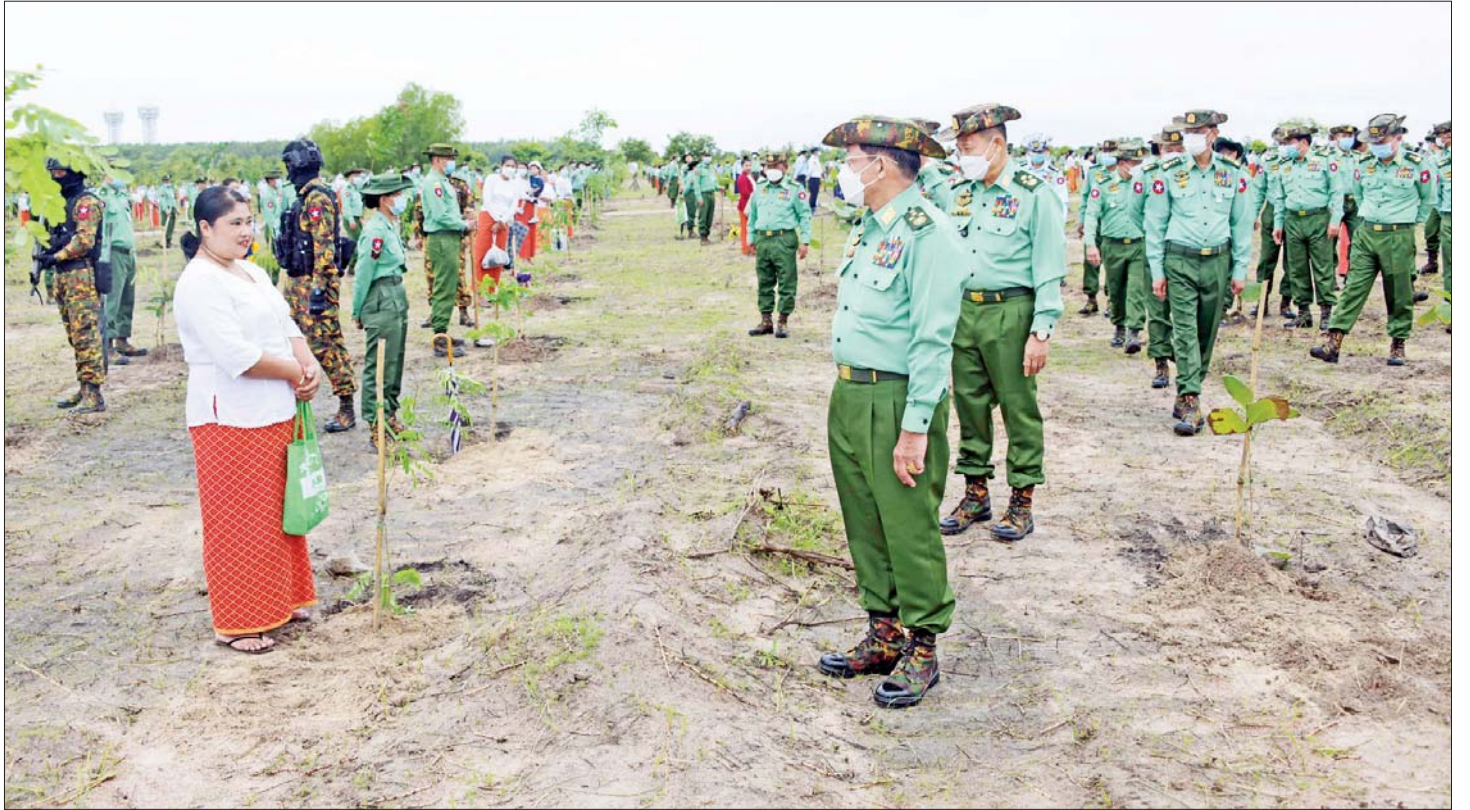
နိုင်ငံတော်စီမံအုပ်ချုပ်ရေးကောင်စီဥက္ကဋ္ဌ တပ်မတော်ကာကွယ်ရေးဦးစီးချုပ် ဗိုလ်ချုပ်မှူးကြီး မင်းအောင်လှိုင်နှင့်အဖွဲ့ဝင်များ၊ အရာရှိ၊ စစ်သည် မိသားစုများ စုပေါင်းသစ်ပင်စိုက်ပျိုးနေမှုအား လှည့်လည်ကြည့်ရှုအားပေးစဉ်။

ဦးစွာ နိုင်ငံတော်စီမံအုပ်ချုပ်ရေးကောင်စီဥက္ကဋ္ဌ တပ်မတော်ကာကွယ်ရေးဦးစီးချုပ်နှင့် ဇနီးတို့က ရတနာတန်းဝင် ကျွန်းပင်ကို ဦးဆောင်စိုက်ပျိုးပေးကြသည်။ ဆက်လက်ပြီး နိုင်ငံတော်စီမံအုပ်ချုပ်ရေးကောင်စီဒုတိယဥက္ကဋ္ဌ ဒုတိယတပ်မတော် ကာကွယ်ရေးဦးစီးချုပ် ကာကွယ်ရေးဦးစီးချုပ် (ကြည်း) နှင့်