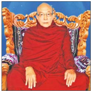
ဖွားမြင်တော်မူခြင်း

နိုင်ငံတော်ဩဝါဒါစရိယ ရှမ်းပြည်နယ် တောင်ကြီးမြို့ အေးသာယာရပ်ကွက် ပထမတောင်ကျောင်းကြီး ပရိယတ္တိစာသင်တိုက် ဦးစီးပဓာနဌာန ဆရာတော်ဘဒ္ဒန္တကောသိယ (အဂ္ဂမဟာပဏ္ဍိတ၊ မဟာသဒ္ဓမ္မဇောတိကဓဇ)၏ ထေရ်ပုဂ္ဂိုလ်အကျဉ်း