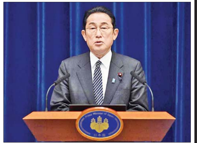
ဂျပန်ဝန်ကြီးချုပ် ဖူမိယို ကိရိုဒါ။

ဂျပန်ဝန်ကြီးချုပ်သည် အိဘာရာကို ပြည်နယ်တွင် ဩဂုတ် ၁၆ ရက်က ၎င်း၏ မိသားစုနှင့်အတူ ဂေါက်သီးရိုက်ခြင်း ကစားခဲ့သည်။ ဩဂုတ် ၁၉ ရက် မွန်းလွဲပိုင်းက တိုကျို မြို့ရှိ ၎င်း၏နေအိမ်သို့ ပြန်လည်ရောက်ရှိပြီးနောက် ဩဂုတ် ၂၀ ရက်တွင် ကိုဗစ်-၁၉ ကူးစက်ခံရသည့်လက္ခဏာ စတင်ပြသခဲ့ပြီး ဩဂုတ် ၂၁ ရက်တွင် ကိုဗစ်-၁၉ ဗိုင်းရပ်စ်ပိုး တွေ့ရှိကြောင်း စစ်ဆေးတွေ့ရှိခဲ့သည်။ ၎င်း၏ ကိုဗစ်-၁၉ ရောဂါလက္ခဏာမှာ အဖျားအနည်းငယ်ရှိပြီး ချောင်းဆိုးခြင်း ခံစားရကြောင်း ဝန်ကြီးချုပ်ရုံးက ပြောသည်။ ဆင်ဟွာ