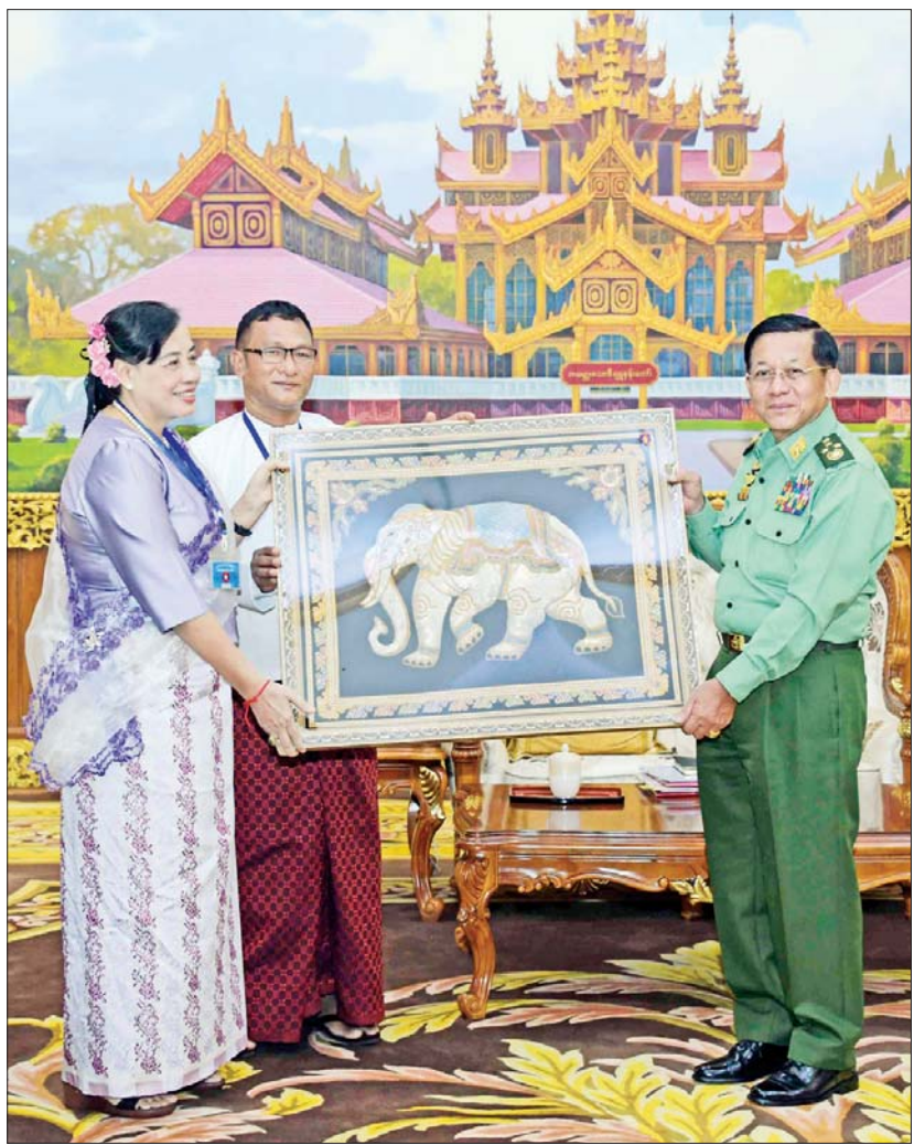
နိုင်ငံတော်စီမံအုပ်ချုပ်ရေးကောင်စီဥက္ကဋ္ဌ တပ်မတော်ကာကွယ်ရေးဦးစီးချုပ် ဗိုလ်ချုပ်မှူးကြီး မင်းအောင်လှိုင်ထံ ရခိုင်ပြည်လွတ်မြောက်ရေးပါတီ (ALP) ဒုတိယဥက္ကဋ္ဌ စောမြရာဇာလင်း လက်ဆောင်ပစ္စည်း ပေးအပ်စဉ်။

ရေးအထိ ညီညွတ်ညွတ်ဖြင့် ကြိုးပမ်း ဆောင်ရွက်သွားရန် လိုအပ်သည့် အခြေအနေများ၊ တိုင်းရင်းသားအားလုံး စည်းလုံးညီညွတ်စွာဖြင့် ကြိုးပမ်းဆောင်ရွက်သွားမည်ဆိုပါက ဖွံ့ဖြိုးတိုးတက်သည့် အနာဂတ်ပြည်ထောင်စု နိုင်ငံတော်ကြီးကို ဖော်ဆောင်သွားနိုင်မည်ဖြစ်သည့် အခြေအနေများ၊ ယခု ဒုတိယအကြိမ် တွေ့ဆုံဆွေးနွေးမှုပြီးလျှင်လည်း ရရှိလာသည့် သဘောထား