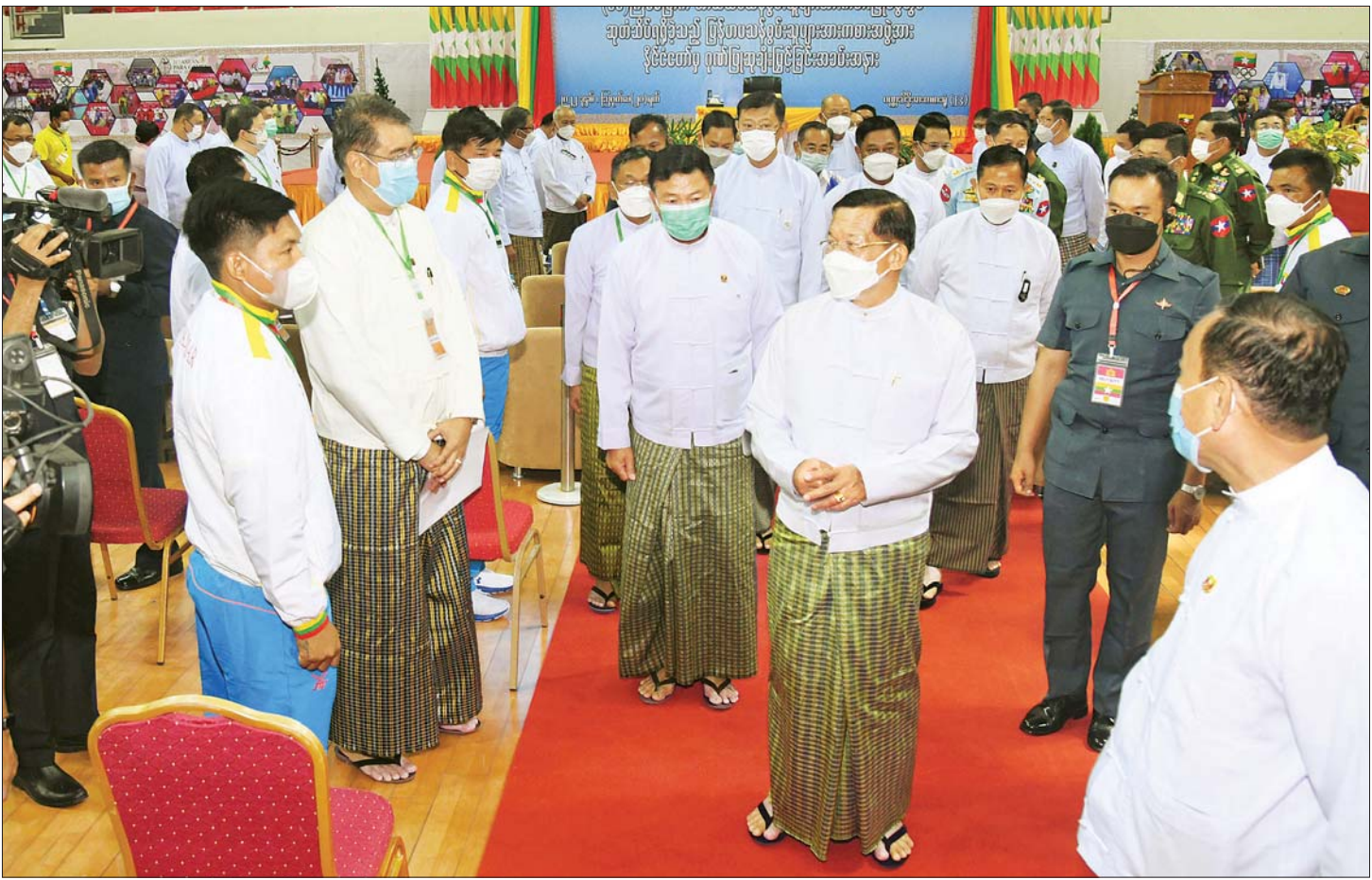
နိုင်ငံတော်စီမံအုပ်ချုပ်ရေးကောင်စီဥက္ကဋ္ဌ နိုင်ငံတော်ဝန်ကြီးချုပ် ဗိုလ်ချုပ်မှူးကြီး မင်းအောင်လှိုင် နိုင်ငံ့ဂုဏ်ဆောင်အားကစားသမားများနှင့် နည်းပြများကို ရင်းရင်းနှီးနှီး နှုတ်ဆက်စဉ်။

နိုင်ငံတော်နှင့် ပြည်သူ့လူထုအပါအဝင် ပံ့ပိုးကူညီ ပေးသော လုပ်ငန်းရှင်များ၊ မြန်မာနိုင်ငံမသန်စွမ်းသူ များ အားကစားအဖွဲ့ချုပ်ဥက္ကဋ္ဌ ဒုတိယဥက္ကဋ္ဌများနှင့် တာဝန်ရှိသူများ၏ အားပေးချီးမြှောက်မှုအပေါ်