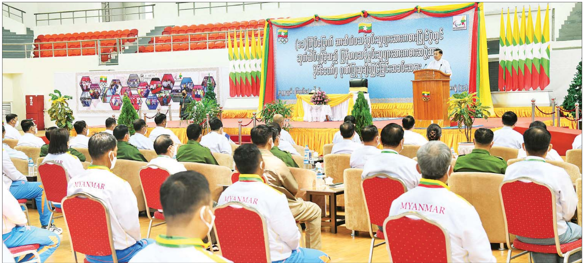
နိုင်ငံတော်စီမံအုပ်ချုပ်ရေးကောင်စီဥက္ကဋ္ဌ နိုင်ငံတော်ဝန်ကြီးချုပ် ဗိုလ်ချုပ်မှူးကြီး မင်းအောင်လှိုင် (၁၁)ကြိမ်မြောက် အာဆီယံမသန်စွမ်းသူများ အားကစားပြိုင်ပွဲတွင် ဆုတံဆိပ်ရရှိခဲ့သော မြန်မာအားကစားအဖွဲ့များအား နိုင်ငံတော်က ဂုဏ်ပြုချီးမြှင့်ခြင်းအခမ်းအနားတွင် အမှာစကားပြောကြားစဉ်။