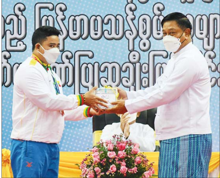
နိုင်ငံတော်စီမံအုပ်ချုပ်ရေးကောင်စီအဖွဲ့ဝင် ဗိုလ်ချုပ်ကြီး တင်အောင်စန်းနိုင်ငံ့ ဂုဏ်ဆောင် ဆုရအားကစားသမားတစ်ဦးအား ဂုဏ်ပြုချီးမြှင့်ပေး အပ်စဉ်။