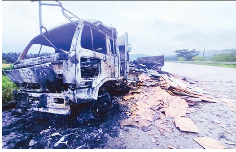
ကျောကရိတ် - မြဝတီသွားအာရုံလမ်းမကြီးတွင် ၁၀ ဘီး မော်တော်ယာဉ်တစ်စီး ပစ်ခတ်မီးရှို့ခံရမှုကို တွေ့ရစဉ်။

နေပြည်တော်၊ ဩဂုတ် ၂၀ ကျောကရိတ်မြို့နယ် ရွာသစ်ကုန်းကျေးရွာ၏ အနောက်ဘက် မီတာ ၁၀၀ ခန့်အကွာရှိ ကျောကရိတ်- မြဝတီသွား အာရုံလမ်းသစ်၌ ဩဂုတ် ၁၉ ရက် ည ၈ နာရီ ၁၅ မိနစ်ခန့်တွင် အိမ်ဆောက်ကြွေပြားများ တင်ဆောင်ပြီး မြဝတီမြို့မှ မော်လမြိုင်မြို့သို့ ပို့ဆောင်ရန် ထွက်ခွာလာ သည့် NISSAN အမျိုးအစား ၁၀ ဘီးမော်တော်ယာဉ် တစ်စီးအား လမ်း ၏ တောင်ဘက် မီတာ ၂၀၀ ခန့်အကွာမှ KKO (ခွဲထွက်)အဖွဲ့နှင့် PDF အမည်ခံ အကြမ်းဖက်သမားများက လက်နက်ငယ် များဖြင့် ပစ်ခတ်ရပ်တန့်စေပြီး မော်တော် ယာဉ်အား မီးရှို့ဖျက်ဆီးခဲ့ကြောင်း သိရှိရ သည်။ အကြမ်းဖက်သမားများ၏ ပစ်ခတ်မှု ကြောင့် ယာဉ်ပေါ်ပါ အမျိုးသားတစ်ဦး လက်နက်ငယ် ထိမှန်ဒဏ်ရာများရရှိခဲ့ပြီး မော်တော်ယာဉ်မှာ မီးလောင်ပျက်စီးသွား