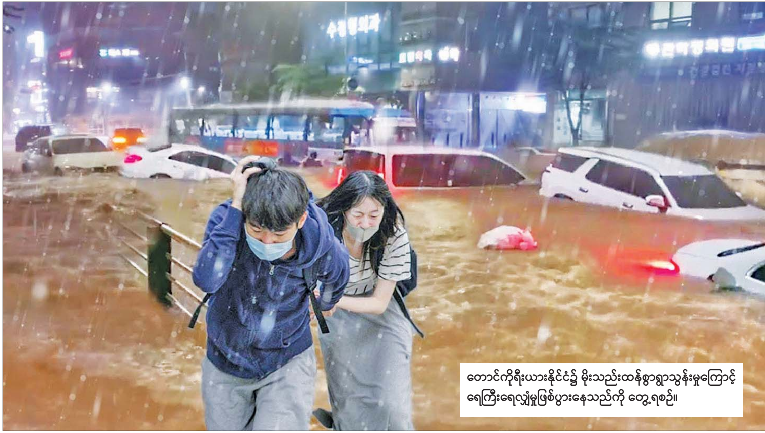
တောင်ကိုရီးယားနိုင်ငံ၌ မိုးသည်းထန်စွာရွာသွန်းမှုကြောင့် ရေကြီးရေလျှံမှုဖြစ်ပွားနေသည်ကို တွေ့ရစဉ်။

ဧရိယာဖြစ်တဲ့ Serra da Estrela မှာ မီးလောင်ကျွမ်းမှုဖြစ်ပွားခြင်းဟာ ၂၀၁၈ ခုနှစ်နောက်ပိုင်း အကြီးမားဆုံး မီးလောင် ကျွမ်းမှုဖြစ်တယ်လို့ ပေါ်တူဂီသဘာဝနဲ့ သစ်တော ထိန်းသိမ်းရေးဆိုင်ရာအဖွဲ့က မကြာသေးခင် ရက်အနည်းငယ်အတွင်း ပြောပါတယ်။ ၁၀ ရက်ကြာ မီးလောင် ကျွမ်းမှုဖြစ်ပွားပြီး ၂၆ ဦး ထိခိုက်ဒဏ်ရာ ရရှိကာ ဟက်တာ ၁၆၀၀၀ ကျော် ထိခိုက် ပျက်စီးမှုဖြစ်ပွားခဲ့တယ်လို့ သိရပါတယ်။ မီးငြိမ်းသတ်ဖို့အတွက် မီးသတ်သမား ၁၇၀၀ နီးပါးကို ယာဉ်အစီးရေ ၅၀၀ ကျော်နဲ့ လေယာဉ် ၁၇ စင်း ပံ့ပိုးပေးခဲ့ရ တယ်လို့ ပေါ်တူဂီအရပ်သား ကာကွယ် ရေး အေဂျင်စီရဲ့ ထုတ်ပြန်ချက်မှာ ဖော်ပြ ထားပါတယ်။