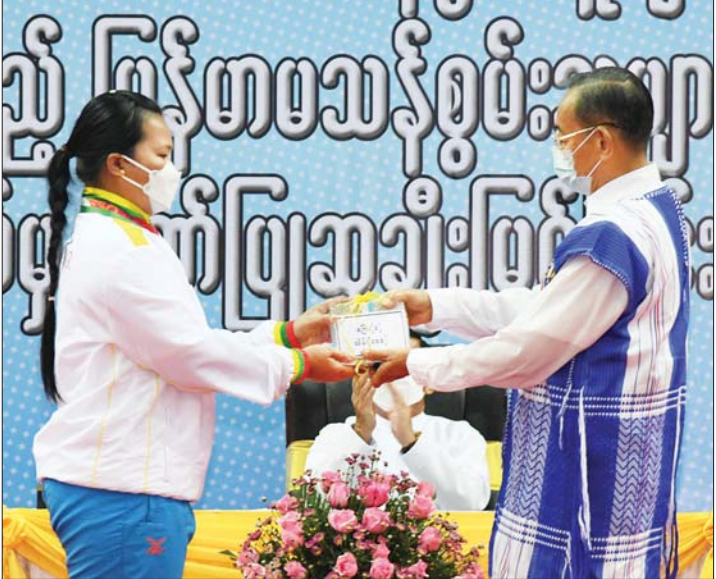
နိုင်ငံတော်စီမံအုပ်ချုပ်ရေးကောင်စီအဖွဲ့ဝင် မန်းငြိမ်းမောင် နိုင်ငံ့ဂုဏ်ဆောင် ဆုရအားကစားသမားတစ်ဦးအား ဂုဏ်ပြုချီးမြှင့်ပေး အပ်စဉ်။