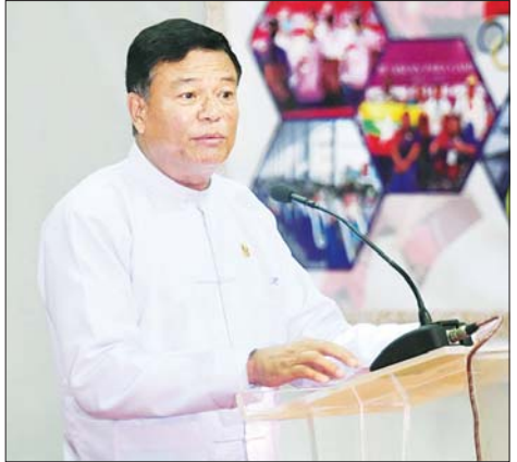
ပြည်ထောင်စုဝန်ကြီး ဦးမင်းသိန်းဇံ ရှင်းလင်းတင်ပြ စဉ်။

အလားတူ ယခုဂုဏ်ပြုပွဲတွင်လည်း ပြိုင်ပွဲ မသွားမီ ကြိုတင်အသိပေး ကြေညာထားသည့် အတိုင်း တစ်ဦးချင်းပြိုင်ပွဲများတွင် ရွှေတံဆိပ်ရရှိ