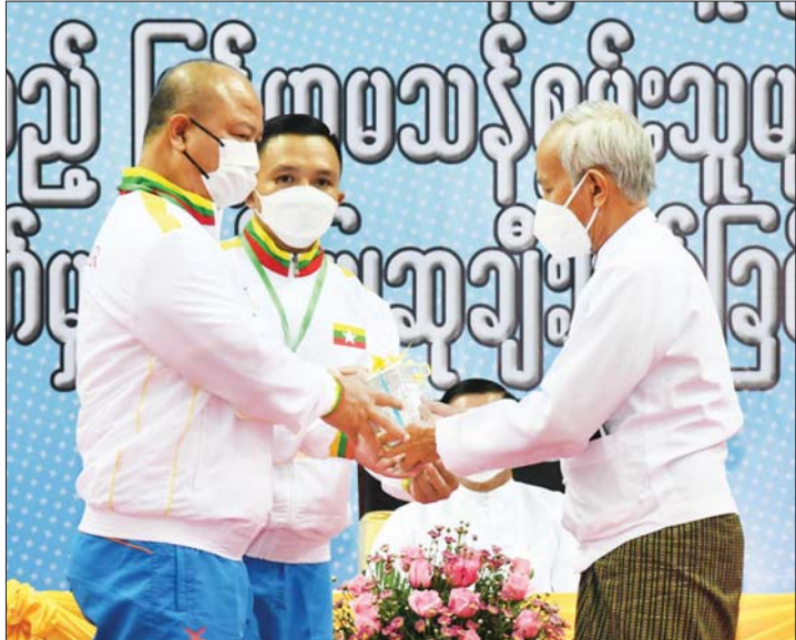
နိုင်ငံတော်စီမံအုပ်ချုပ်ရေးကောင်စီအဖွဲ့ဝင် ဦးမောင်ဟာ နိုင်ငံ့ဂုဏ်ဆောင် ဆုရအားကစားသမားတစ်ဦးအား ဂုဏ်ပြုချီးမြှင့်ပေး အပ်စဉ်။