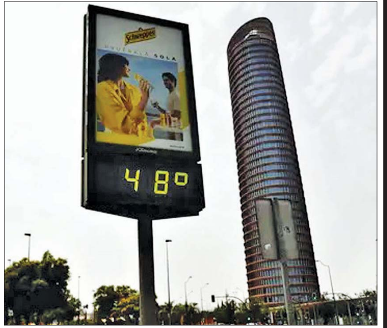
စပိန်နိုင်ငံ ဆီးယာမြို့၌ အပူချိန် ၄၈ ဒီဂရီဆဲလ်စီးယပ်ပြသနေသည့် ဘုတ်ပြားကို တွေ့ရစဉ်။

ဒါ့အပြင် ရာသီဥတုပြောင်းလဲမှု ဘေးအန္တရာယ်ကို လောကလူသားတွေ ကြုံတွေ့နေရပြီး သက်ရောက်မှုတွေ ကလည်း စိုးရိမ်ဖွယ်ရာအခြေအနေတွေ ဖြစ်တာကြောင့် သိသာထင်ရှားတဲ့ ကမ္ဘာ လုံးဆိုင်ရာ လုပ်ဆောင်မှုတွေ လိုအပ်ပါ ကြောင်း။ ။