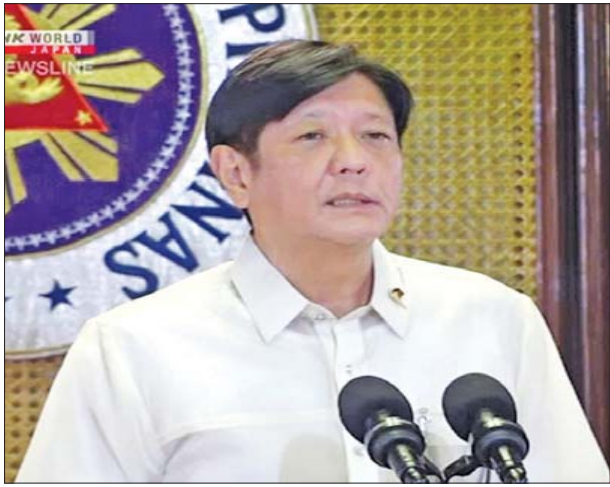
ဖိလစ်ပိုင်သမ္မတ ဖာဒီနန်မားကိုစ် ဂျူနီယာ။

ဖိလစ်ပိုင် သမ္မတ မားကိုစ်ဂျူနီယာသည် နှစ်နိုင်ငံဆက်ဆံရေးကို ခိုင်မာအားကောင်းစေလိုသော အမေရိကန်သမ္မတ ဂျိုးဘိုင်ဒင်၏ ဖိတ်ကြားမှုကို လက်ခံရရှိပြီးနောက် ဝါရှင်တန်သို့ သွားရောက်လည်ပတ်ရန် စဉ်းစားခဲ့ကြောင်း ဖိလစ်ပိုင်နိုင်ငံခြားရေးဝန်ကြီးဌာနက ပြောကြားသည်။