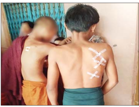
Drone ယာဉ်ဖြင့် ပစ်ခတ်တိုက်ခိုက်ခဲ့မှုကြောင့် ကိုရင်နှင့် ကျောင်းသားများ ထိခိုက်ဒဏ်ရာရရှိမှုကို တွေ့ရစဉ်။

■ ကျောဖုံးမှ စာသင်ကြားလျက်ရှိနေသော ကျောင်းသား သုံးဦး၊ ကိုရင်တစ်ပါးတို့တွင် ဗုံးစထိမှန်ဒဏ်ရာများ ရရှိခဲ့ သည်။ ဖြစ်စဉ်တွင် ထိခိုက်ဒဏ်ရာရရှိခဲ့သူများကို လိုအပ်သည့် ဆေးဝါးကုသမှုများ ဆောင်ရွက်ပေးလျက် ရှိကြောင်းနှင့် PDF အမည်ခံ အကြမ်းဖက်သမားများအား ဖော်ထုတ်ဖမ်းဆီး အရေးယူနိုင်ရေး လုံခြုံရေးတပ်ဖွဲ့ ဝင်များက လုံခြုံရေးလုပ်ငန်းစဉ်များနှင့်အညီ ကြိုပမ်းဆောင်ရွက်လျက်ရှိကြောင်း သတင်းရရှိသည်။