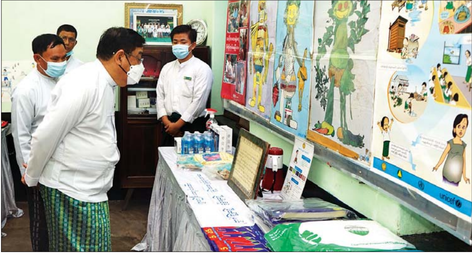
ပညာပေးပြခန်းတွင် တိုင်းဒေသကြီးဝန်ကြီးချုပ် လိုက်လံကြည့်ရှုစဉ်။

မြတ် ဩဂုတ် ၂၀ တနင်္ဂနွေရက်တိုင်းဒေသကြီး မြတ်မြို့၌ ကမ္ဘာ့မိခင် နို့တိုက်ကျွေးရေးရက်သတ္တပတ်နှင့် အာဟာရဖွံ့ဖြိုး ရေး ရက်သတ္တပတ်များ တိုင်းဒေသကြီးအဆင့် အထိမ်းအမှတ်အခမ်းအနားကို အ.ထ.က(၃)မြတ် ပညာရတနာခန်းမ၌ ဩဂုတ် ၁၈ ရက်က ကျင်းပ ရာ တိုင်းဒေသကြီးဝန်ကြီးချုပ် ဦးမြတ်ကို တက်ရောက်၍ အမှာစကားပြောကြားပြီး အသက် ငါးနှစ်အောက်ကလေးများ စီတာမင်အဆေးလုံး များ တိုက်ကျွေးပေးသည်။ တိုင်းဒေသကြီးဝန်ကြီးချုပ်က ကမ္ဘာ့ကျန်းမာ ရေးအဖွဲ့က မိခင်နို့သည် ကလေးအတွက် အကောင်း ဆုံးနှင့် အသင့်လျော်ဆုံး အစာအာဟာရဖြစ်ပြီး မွေးစ မှ ကလေးအသက် ခြောက်လအထိ မိခင်နို့တစ်မျိုး တည်းသာတိုက်ကျွေးရန်၊ ကလေးအသက်ခြောက်လ ပြည့်သည့်အခါတွင်လည်း ဖြည့်စွက်စာနှင့်အတူ အနည်းဆုံး ကလေးအသက် နှစ်နှစ်အထိ မိခင်နို့ကို ဆက်လက်တိုက်ကျွေးရန် အကြံပြုထားကြောင်း၊ မိခင်နို့ စနစ်တကျတိုက်ကျွေးရေးနှင့် ပတ်သက်ပြီး မှန်ကန်သည့် သတင်းအချက်အလက်များ၊ မလိုအပ် ဘဲ နို့မို့နို့တိုက်ကျွေးပါက ဖြစ်လာတတ်သည့် ဆိုးကျိုး များကို ပြည့်သူ့လူထုသိရှိအောင် အသိပညာပေး