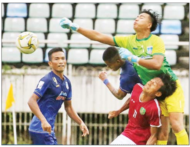
ရတနာပုံနှင့် မြဝတီအသင်း ယှဉ်ပြိုင်နေစဉ်။

MNL အမှတ်ပေးပြိုင်ပွဲ မြဝတီကို ရတနာပုံအသင်း အနိုင်ယူ ရန်ကုန် ဩဂုတ် ၁၇ ၂၀၂၂ ရာသီ MNL အမှတ်ပေးပြိုင်ပွဲ ပွဲစဉ် (၈) စတုတ္ထနေ့အဖြစ် ရတနာပုံနှင့် မြဝတီအသင်းတို့ ဩဂုတ် ၁၇ ရက်က သုဝဏ္ဏကွင်း၌ ယှဉ်ပြိုင်ကစားရာ ရတနာပုံအသင်းက မြဝတီအသင်းကို နှစ်ဂိုး-ဂိုးမရှိဖြင့် အနိုင်ရခဲ့သည်။ ယခုရာသီတွင် ရလဒ်ကောင်းများ ဆက်တိုက်ရပြီး ဇယားထိပ်ပိုင်းရောက်ရှိနေသည့် မြဝတီအသင်းသည် ယခုပွဲတွင် ရတနာပုံအသင်းကို အရေးနိမ့်ပြီး စာမျက်နှာ ၁၂ ကော်လံ ၁ ❖