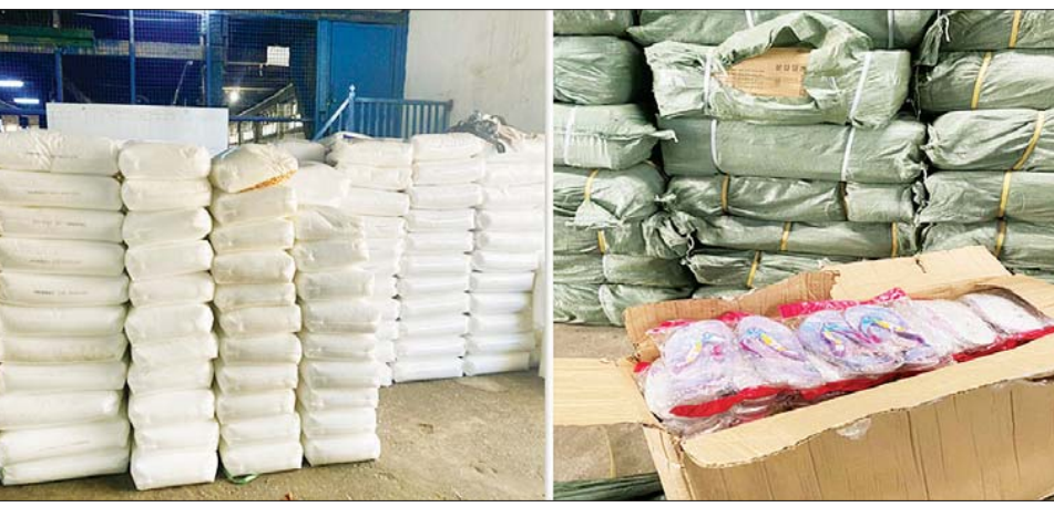
ရန်ကုန်တိုင်းဒေသကြီးအတွင်း သိမ်းဆည်းရမိသည့်ပစ္စည်းများ။

နေပြည်တော် ဩဂုတ် ၁၇ တရားမဝင်ကုန်သွယ်မှု တိုက်ဖျက်ရေးဦးဆောင် ကော်မတီ၏ ကြီးကြပ်ကွပ်ကဲမှုဖြင့် တရားမဝင် ကုန်သွယ်မှုများကို ဥပဒေနှင့်အညီ ထိရောက်စွာ တားဆီးအရေးယူနိုင်ရေး ဆောင်ရွက်လျက်ရှိရာ ဩဂုတ် ၁၃ ရက်တွင် ရန်ကုန်တိုင်းဒေသကြီး တရားမဝင်ကုန်သွယ်မှု တိုက်ဖျက်ရေးအထူးအဖွဲ့၏ စီမံခန့်ခွဲမှုဖြင့် အကောက်ခွန်ဦးစီးဌာန စုံစမ်း စစ်ဆေးရေးနှင့် တရားမဝင်ကုန်သွယ်မှု တိုက်ဖျက် ရေး ဌာနခွဲမှ တာဝန်ကျစစ်ဆေးရေးအဖွဲ့က ရန်ကုန်- မန္တလေးလမ်းပေါင်း ကုန်သွယ်မှုလမ်းမကြီး တစ်လျှောက် အခွန်ပေးဆောင်ထားသည့် ကုန်ပစ္စည်း များထက် ပိုမိုတင်ဆောင်လာကြောင်း သတင်းအရ စစ်ဆေးမှုများဆောင်ရွက်ခဲ့ရာ သွင်းကုန်ကြေညာ လွှာ (ID) တွင် ကြေညာထားသည်ထက် ပိုမို တင်ဆောင်လာသော ဓာတုကုန်ကြမ်းပစ္စည်းများနှင့် လူသုံးကုန်ပစ္စည်းများ (ခန့်မှန်းတန်ဖိုးငွေကျပ် ၂၁၀၀၉၂၈၀) နှင့် အဆိုပါပစ္စည်းများ တင်ဆောင် လာသည့် နောက်တွဲယာဉ် (Semi Trailer) ပါ Mitsubishi Fuso အမျိုးအစား ကုန်တင်ယာဉ်တစ်စီး (ခန့်မှန်းတန်ဖိုးငွေကျပ် ၄၀၀၀၀၀၀) စုစုပေါင်း (ခန့်မှန်းတန်ဖိုးငွေကျပ် ၆၁၀၀၉၂၈၀) ကို ဖမ်းဆီး ရမိခဲ့ပြီး အကောက်ခွန်လုပ်ထုံးလုပ်နည်းနှင့်အညီ အရေးယူ ဆောင်ရွက်လျက်ရှိသည်။