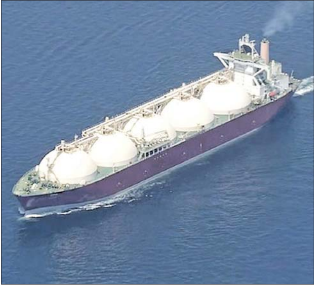
ရေးဆိုင်ရာ စက်ပစ္စည်းများ တင်ပို့ရောင်းချမှု အားကောင်းလာသည့်အတွက် ၁၉ ရာခိုင်နှုန်း မြင့်တက်လာခဲ့ကြောင်း သိရသည်။ အင်န်အိတ်ချ်ကေ

သွင်းကုန်ကဏ္ဍတွင် ရေနံစိမ်း၊ ကျောက်မီးသွေး၊ သဘာဝဓာတ်ငွေ့နှင့် အခြားသော စွမ်းအင်ထုတ်ကုန်များ၏ ဈေးနှုန်းများ မြင့်မားလာခြင်းကြောင့် ယခင်နှစ်က အလားတူကာလနှင့် နှိုင်းယှဉ်ကြည့်ပါက ယခုနှစ်တွင် ၄၇ ဒသမ ၂ ရာခိုင်နှုန်း မြင့်တက်လာခြင်းဖြစ်သည်။ ပို့ကုန်ကဏ္ဍတွင် မော်တော်ကားများနှင့် ဆီမီးကွန်ဒက်တာ ထုတ်လုပ်