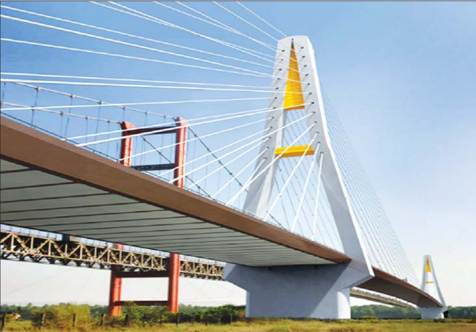
ဂျိုင်း(ဇာသပြင်)တံတားသစ် တည်ဆောက်ပြီးပါက တွေ့မြင်ရမည့်ပုံ။