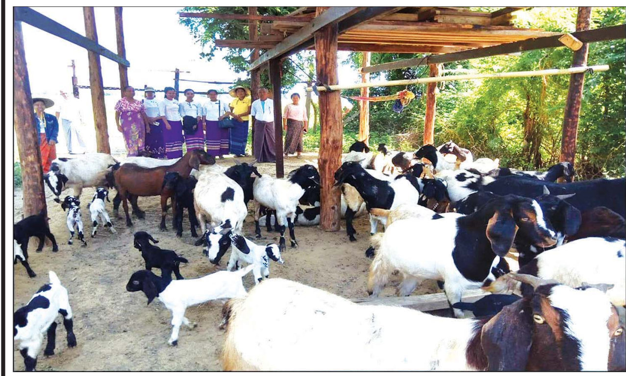
သာစည်မြို့နယ် ကန်ဖြူကျေးရွာ မြစ်ရောင်းစီမံကိန်း ဆိတ်မွေးမြူရေးလုပ်ငန်းကို တွေ့ရစဉ်။

အမ်း ဩဂုတ် ၁၇ ရခိုင်ပြည်နယ် အမ်းမြို့နယ် ကျေးလက်ဒေသ ဖွံ့ဖြိုးတိုးတက်ရေးဦးစီးဌာန ဦးစီးမှူး ဦးညီညီ (လက်ထောက်ညွှန်ကြားရေးမှူး) ၊ ဦးအောင်သူမြင့်၊ ဒုတိယဦးစီးမှူးနှင့်အဖွဲ့သည် ဩဂုတ် ၁၆ ရက်တွင် အမ်းမြို့နယ် ကျေးလက်ဦးစီးဌာနက ၂၀၂၂-၂၀၂၃ ဘဏ္ဍာနှစ်တွင် မြစ်ရောင်းကျေးရွာစီမံကိန်း (Type-4) လည်ပတ်ရန်ပုံငွေကျပ် သိန်း ၃၀၀ ဖြင့် အမ်းမြို့နယ် လုံးကောက်ကျေးရွာအုပ်စု ခရမ်းကျွန်းကျေးရွာနှင့် ငလက်ကျေးရွာ နှစ်ရွာပေါင်း တစ်ယူနစ်အကောင်အထည်ဖော် ဆောင်ရွက်နိုင်ရန် အဆိုပါကျေးရွာများသို့ မြေပြင်ကွင်းဆင်းသွားရောက်ကာ ကျေးရွာသူ ကျေးရွာသားများနှင့် တွေ့ဆုံ၍ စီမံကိန်းအကြောင်းအရာများ မိတ်ဆက်ရှင်းလင်းပြီး ကျေးရွာလူထုမှ မဲစနစ်ဖြင့်ရွေးချယ်သည့် ကျေးရွာ မြစ်ရောင်းရန်ပုံငွေကြီးကြပ်မှုကော်မတီအား ဖွဲ့စည်းခဲ့သည်။ ထို့ပြင် ၂၀၂၂-၂၀၂၃ ဘဏ္ဍာနှစ် ပြည်ထောင်စုရန်ပုံငွေကျပ် ၂၇ ဒသမ ၀၀ သန်းဖြင့် ဖြိုးဝေဝေကုမ္ပဏီက ဆောင်ရွက်လျက်ရှိသည့် အမ်းမြောက်ကျေးရွာအုပ်စု နေကာရွာသစ်ကျေးရွာ စီမံစမ်းရေသွယ်တန်းခြင်းလုပ်ငန်း (၁/၀) မိုင် ဆောင်ရွက်နေမှုကို ကွင်းဆင်းစစ်ဆေးခဲ့ကြောင်း သိရသည်။ အောင်လှဖြူ (ရမ်းမြ)