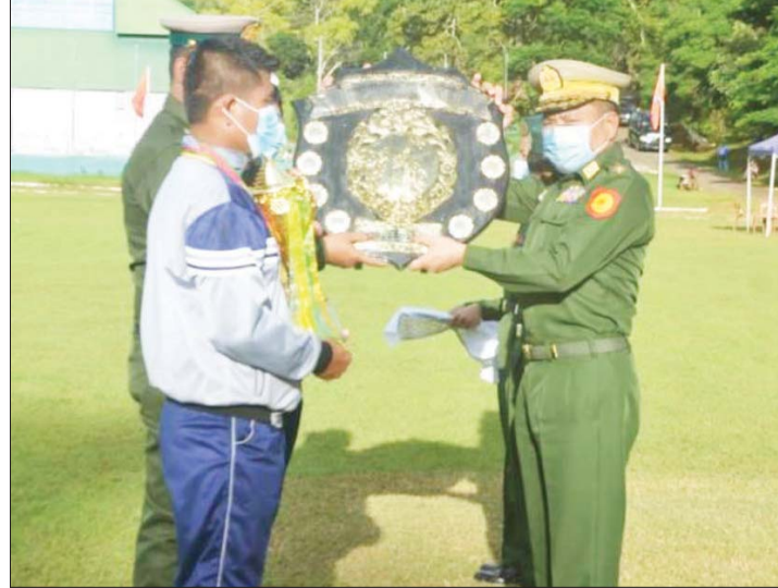
၂၀၂၂ ခုနှစ် တိုင်းမှူးခိုင်းဆု ရရှိသည့် အသင်းအား တိုင်းမှူး ဗိုလ်ချုပ် နီလင်းအောင် ဆုချီးမြှင့်စဉ်။

နေပြည်တော် ဩဂုတ် ၁၇ အရှေ့ပိုင်း တိုင်းစစ်ဌာနချုပ်၏ ၂၀၂၂ ခုနှစ် တိုင်းမှူးခိုင်း ပြေး၊ ခုနစ်၊ ပစ် (အမျိုးသား၊ အမျိုးသမီး) ပြိုင်ပွဲ ဗိုလ်လုပွဲနှင့်ဆုပေးပွဲကို ယနေ့မွန်းလွဲပိုင်းတွင် တိုင်းစစ်ဌာနချုပ် ဘောလုံးကွင်း၌ ပြုလုပ်ရာ တိုင်းမှူး ဗိုလ်ချုပ် နီလင်းအောင်နှင့်အဖွဲ့ဝင်များ၊ အရာရှိစစ်သည်၊ မိသားစုများ၊ ပြိုင်ပွဲဝင်အားကစားသမားများ၊ ခိုင်းအဖွဲ့ဝင်များနှင့် အားကစားဝါသနာရှင်များ တက်ရောက်ကြသည်။