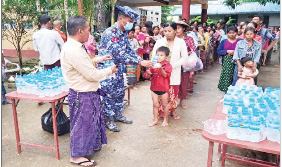
ရေဘေးသင့်ပြည်သူများအား သောက်သုံးရေနှင့် စားသောက်ဖွယ်ရာများ ထောက်ပံ့ပေးအပ်စဉ်။

အစိုးရရပ်ကွက်၊ စေတီတောင် ရပ်ကွက်၊ ကုလားဘာတောင် ရပ်ကွက်နှင့်မြစ်နားတန်းရပ်ကွက် တို့၌ ဩဂုတ် ၁၆ ရက်နှင့် ယနေ့တို့တွင် မိုးသည်းထန်စွာ ရွာသွန်းပြီး လေပြင်းတိုက်ခတ်မှု များကြောင့် ရေငရဲရောက်မှုများ ဖြစ်ပေါ်ခဲ့သဖြင့် တောင်ကမ်းပါး ယံပြိုကျခြင်း၊ အဆောက်အအုံ၊ လူနေအိမ်၊ ဈေးဆိုင်များပျက်စီး ခြင်း၊ အခြေခံပညာကျောင်းများ အုတ် တံတိုင်းပျက်စီးခြင်း၊ ကျေး လက်ဆေးပေးခန်းတို့မှာ အမိုး လန်ပျက်စီးခြင်းနှင့် တံတားများ ပျက်စီးခြင်းများ ဖြစ်ပေါ်ခဲ့သဖြင့် သစ်လုံးများ ရိုက်ခြင်းနှင့် လိုအပ် သည့်ကူညီကယ်ဆယ်ရေးလုပ်ငန်း များ ဆောင်ရွက်ပေးခဲ့ကြသည်။ ထိုသို့ဆောင်ရွက်နေမှုများကို သက်ဆိုင်ရာ ပြည်နယ်ဝန်ကြီး ချုပ်၊ တိုင်းမှူးများနှင့် တာဝန် ရှိသူများက သွားရောက်ကြည့်ရှု အားပေးကြပြီး လိုအပ်သည် များ ညှိနှိုင်းဆောင်ရွက်ပေးကာ ရေဘေးသင့် ပြည်သူများအား ထောက်ပံ့ငွေများ၊ ကယ်ဆယ်ရေး ပစ္စည်းများနှင့် စားသောက်ဖွယ် ရာများ ထောက်ပံ့ပေးအပ်ခဲ့ကြ ကြောင်း သိရသည်။ သတင်းစဉ်