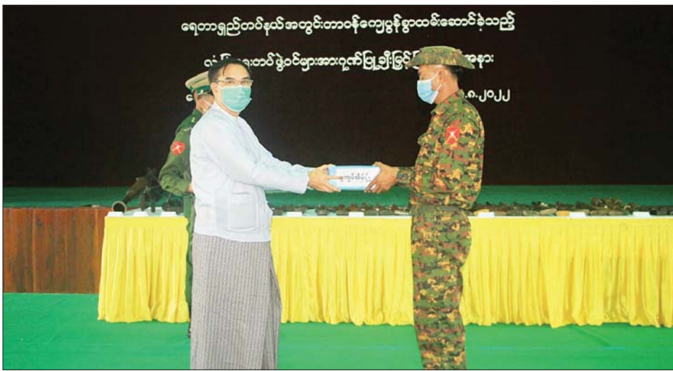
ထိုစဉ်က ဩဂုတ် ၁၇ ရက် တွင် ရေတာရှည်မြို့နယ် စည်ပင် သမားများနှင့် ထိတွေ့မှုဖြစ်စဉ် တွင် လုံခြုံရေးတပ်ဖွဲ့ဝင်များ ထိခိုက်မှုမရှိဘဲ လက်နက် ခဲယမ်းများစွာ သိမ်းဆည်း ရရှိခဲ့မှုအပေါ် ချီးမြှင့်ဂုဏ်ပြု စကားများ ပြောကြားသည်။

ရေတာရှည် တပ်နယ်အတွင်း အကြမ်းဖက် သောင်းကျန်းသူ များထံမှ လက်နက်ခဲယမ်းများ ဖမ်းဆီးရမိခဲ့သည့် လုံခြုံရေး တပ်ဖွဲ့များအား ချီးကျူးဂုဏ်ပြု ခြင်း အခမ်းအနားကို ယနေ့ နံနက်ပိုင်းတွင် ပဲခူးတိုင်းဒေသ ကြီး ရေတာရှည်မြို့နယ် ရေနီမြို့ အမှတ်(၅) စစ်အခြေစိုက်ရေး တပ် နယ်မြေခံတပ်နယ်ခန်းမ ၌ ကျင်းပသည်။