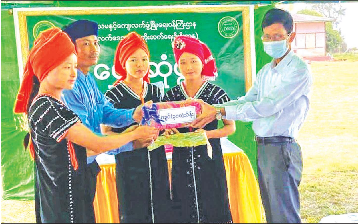
ဒုတိယဝန်ကြီး ဦးမြင့်စိုး ကလောမြို့နယ် ဘော်နင်းစံပြကျေးရွာ (SMART Village) အတွက် မြစ်မ်းရောင်ရန်ပုံငွေ လွှဲပြောင်းပေးအပ်စဉ်။

ကျေးရွာသူ ကျေးရွာသားများ စိုက်ပျိုးရေး၊ မွေးမြူရေးနှင့် အခြားသောလူမှုစီးပွားဘဝအခြေအနေ မြင့်မားတိုးတက်လာစေမည့်