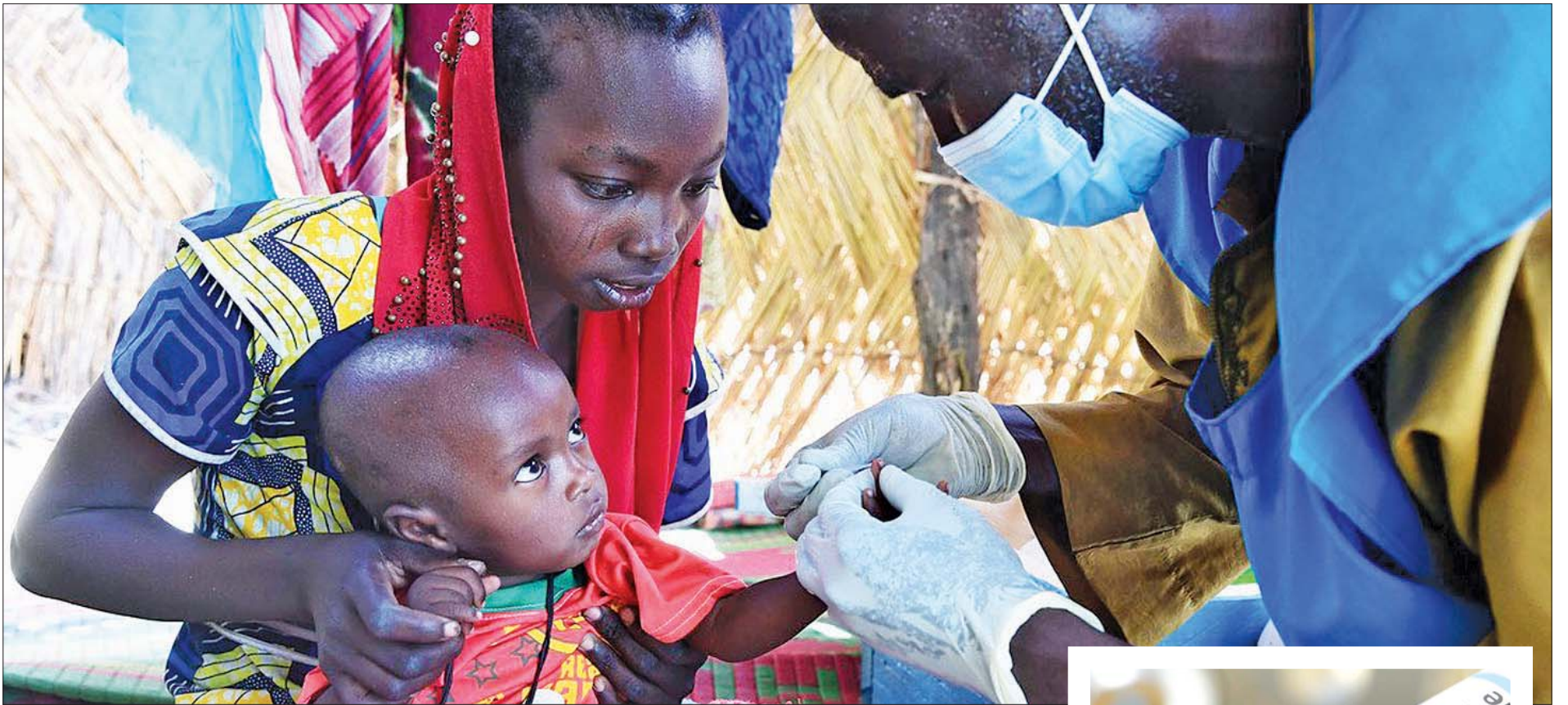
ချွန်နိုင်ငံရှိ ကျေးလက်ကျန်းမာရေးဌာန၌ ကလေးငယ်တစ်ဦးအား ငှက်ဖျားရောဂါ ရှိ မရှိ စမ်းသပ်စစ်ဆေးစဉ်။