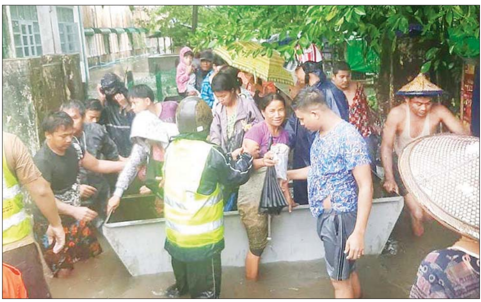
ကျောက်ဖြူမြို့နယ်ရှိ ရေဘေးသင့်ပြည်သူများအား နယ်မြေခံတပ်မတော်သားများနှင့် ကယ်ဆယ်ရေး အဖွဲ့များက ကူညီကယ်ဆယ်ရေးဆောင်ရွက်စဉ်။

မြို့ရိုးမြို့မ ၄ ရပ်ကွက်၊ အုတ်ကျင်း ရပ်၊ လမိုင်းမြို့နယ်၊ ပေါင်မြို့နယ်၊ အလုပ်ကျေးရွာ၊ ကရင်ပြည်နယ် ကြာအင်းဆိပ်ကြီး မြို့နယ်၊ မော်လမြိုင်မြို့ရိုး သီရိမြိုင် ရပ်ကွက်၊ ရန်ကုန်တိုင်းဒေသကြီး အတွင်း မင်္ဂလာဒုံမြို့နယ်ရှိ ပေါက်ကုန်းရပ်ကွက်နှင့် ပလရ ရပ်ကွက်၊ ကြံခင်းစုရပ်ကွက်၊ မှော်ဘီမြို့နယ် သန္ဓေပင်ကျေးရွာ အုပ်စု ထိန်စွန်းကျေးရွာနှင့် သံတံတားကျေးရွာ၊ သန်လျင်မြို့ နယ် ဗိုလ်ချုပ်ကျေးရွာ၊ အေး သာယာရပ်ကွက်၊ ကျောင်းတန်း မြို့နယ် မရမ်းဘေးကျေးရွာ၊ ပုတ္တ