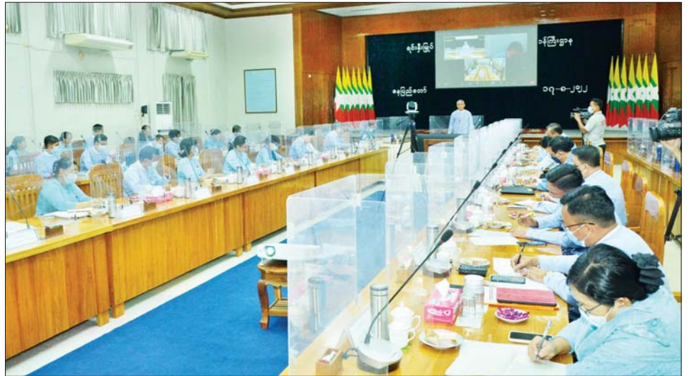
လုပ်ငန်းညှိနှိုင်းအစည်းအဝေးတွင် နိုင်ငံတော်စီမံ အစီအစဉ်များကို ဆွေးနွေးပြောကြားခဲ့ကြောင်း အုပ်ချုပ်ရေးကောင်စီဥက္ကဋ္ဌ၏ လမ်းညွှန်မှာကြား သိရသည်။ ချက်များအပေါ် ရှေ့ဆက်လက်ဆောင်ရွက်ရမည့် သတင်းစဉ်

ဆက်လက်၍ ဒုတိယဝန်ကြီးက ဝန်ကြီးဌာန၏ လုပ်ငန်းများ အကောင်အထည်ဖော်မှုနှင့် စပ်လျဉ်း သည့် သုံးသပ်ချက်များကို လည်းကောင်း၊ ပြည်ထောင်စုအဆင့် အဖွဲ့အစည်းများနှင့် ပြည်ထောင်စုဝန်ကြီးဌာနများ၏ ခြောက်လပတ် လုပ်ငန်းဆောင်ရွက်ချက်များနှင့် စပ်လျဉ်းသည့်