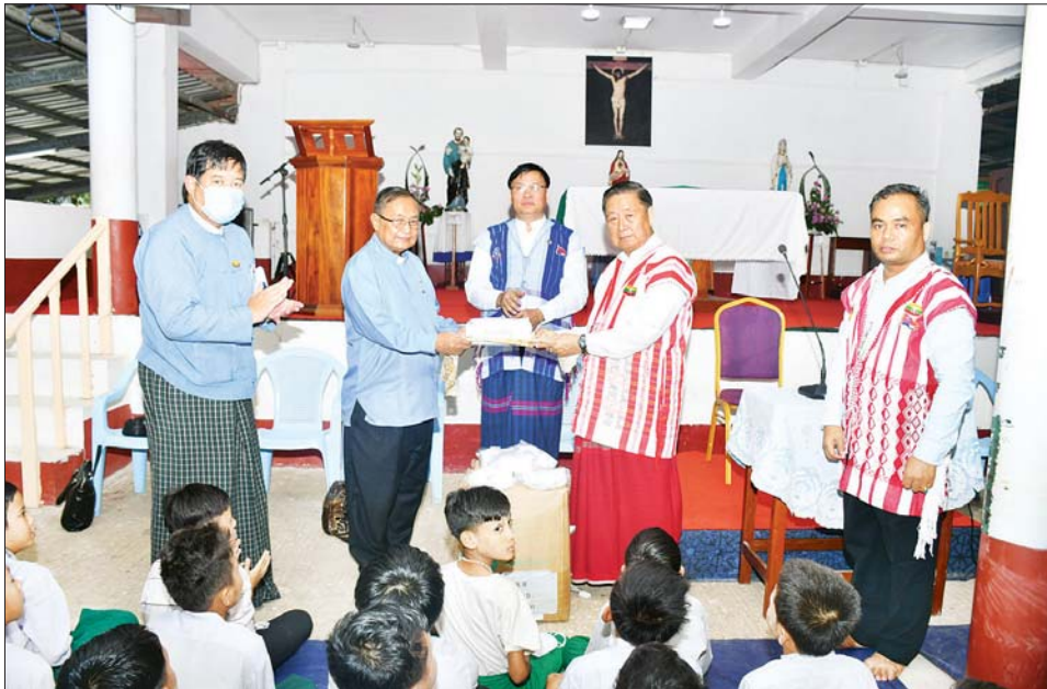
ပြည်ထောင်စုဝန်ကြီး ဦးစောထွန်းအောင်မြင့် ကက်သလစ်ခရစ်ယာန်ပရဟိတဂေဟာသို့ ထောက်ပံ့ပစ္စည်းများ ပေးအပ်စဉ်။

ဗြိတိန် ဩဂုတ် ၁၇ တိုင်းရင်းသားလူမျိုးများရေးရာဝန်ကြီးဌာန ပြည်ထောင်စုဝန်ကြီး ဦးစောထွန်းအောင်မြင့် သည် တနင်္သာရီတိုင်းဒေသကြီး တိုင်းရင်းသားရေးရာဝန်ကြီး ဦးစောမာတင်လှသာ၊ တာဝန်ရှိသူများနှင့် အတူ ယနေ့ နံနက် ၁၁ နာရီတွင် တနင်္သာရီတိုင်းဒေသကြီး မြိတ်မြို့နယ် ကလောင်ပုဂံရပ်ကွက်ရှိ ကက်သလစ်ခရစ်ယာန်ပရဟိတဂေဟာသို့ သွားရောက်ပြီး သာသနာပိုင်ဘုန်းတော်ကြီး ဘရူနိုလစ် သာသနာပြုဆရာ ဆရာမများ၊ ကျောင်းသားကျောင်းသူများနှင့် တွေ့ဆုံသည်။ တွေ့ဆုံစဉ် ပြည်ထောင်စုဝန်ကြီးက ကျောင်းသား ကျောင်းသူများအနေဖြင့် ငြိမ်းချမ်းရေးနှင့် တိုင်းရင်းသားစည်းလုံးညီညွတ်ရေးကို ငယ်စဉ်ကတည်းက သိရှိထားကြရမည် ဖြစ်ကြောင်း၊ ငြိမ်းချမ်းရေးသည်သာလျှင် တိုင်းပြည်နှင့်လူမျိုးကို ဖွံ့ဖြိုးတိုးတက်အောင် ဆောင်ကြဉ်းပေးနိုင်မည်ဖြစ်ကြောင်း၊ မိမိတို့ ကိုးကွယ်ယုံကြည်ရာဘာသာတရားကို အလေးထား၍ မိဘကျေးဇူး၊ သင်ဆရာ၊ မြင်ဆရာများ၏ ကျေးဇူးကိုဆပ်နိုင်အောင် ကြိုးစားသင်ယူပြီး တိုင်းပြည်ဖွံ့ဖြိုးတိုးတက်ရေးကိုလည်း အထောက်အကူပြုစေရန် ကြိုးစားအားထုတ်ကြရမည်ဖြစ်ကြောင်း အားပေးစကားပြောကြားသည်။