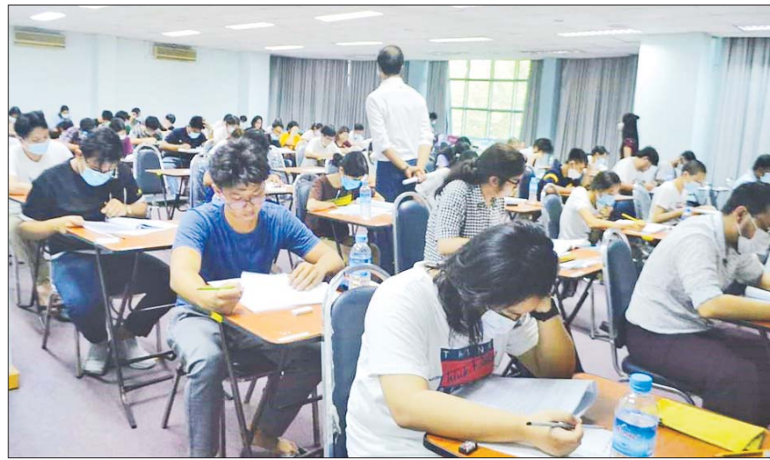
ဧပြီလက စစ်ဆေးခဲ့သော စာမေးပွဲတွင် ဖြေဆိုနေသူများ။

စာမေးပွဲများကို အောက်တိုဘာ ၂၃ ရက် တစ်ရက်တည်းတွင် အချိန်များခွဲ၍ စစ်ဆေး မည်ဖြစ်ပြီး စာမေးပွဲတွင် ကွန်ပျူတာ တက္ကသိုလ် ကျောင်းသား ကျောင်းသူများ၊