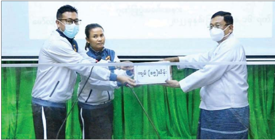
အနေဖြင့် ပြည်နယ်ကိုယ်စားပြု အားကစားသမား တစ် ကြီးစားကြစေလိုကြောင်း ပြောကြားသည်။ ကောင်းများမှသည် နိုင်ငံလက်ရွေးစင် အားကစား ပေးအပ်ချီးမြှင့် သမားများကောင်းများ ဖြစ်ထွန်းလာစေရေး စွမ်းစွမ်း ဆက်လက်၍ မွန်ပြည်နယ် အသက် (၁၉) နှစ်

မော်လမြိုင် ဩဂုတ် ၁၇ ၂၀၂၂ ခုနှစ် တိုင်းဒေသကြီးနှင့် ပြည်နယ် အားကစား ပြိုင်ပွဲများတွင် ဒုတိယဆုရရှိခဲ့သော မွန်ပြည်နယ် အသက်(၁၉)နှစ်အောက်အမျိုးသားဘောလုံးအသင်း နှင့် ပိုက်ကျော်ခြင်းအသင်းတို့အား ဂုဏ်ပြုပွဲအခမ်း အနားကို ယမန်နေ့က ပြည်နယ်အစိုးရအဖွဲ့ရုံး အောင်ဆန်းခန်းမ၌ ကျင်းပသည်။