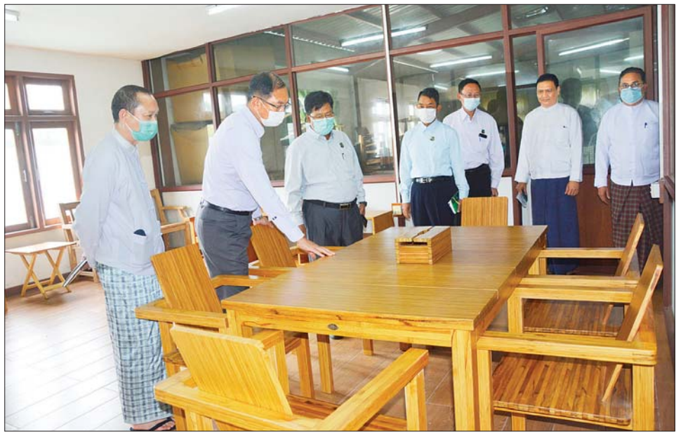
ဝါးကုန်ချောပစ္စည်းနှင့် ပရိဘောဂထုတ်လုပ် နေမှုကို လိုက်လံကြည့်ရှုစစ်ဆေးပြီး လိုအပ်သည် များ မှာကြားသည်။ မွန်းလွဲပိုင်းတွင် ပြည်ထောင်စုဝန်ကြီးသည် တောင်ငူဣလပ်မြို့နယ်ရှိ Green Gold Industry

ထို့နောက် ပြည်ထောင်စုဝန်ကြီးသည် သစ် အချောထည်စက်ရုံအတွင်း တန်ဖိုးမြှင့်သစ်အချော ထည် ပစ္စည်းများထုတ်လုပ်နေမှု လုပ်ငန်းအဆင့်ဆင့်