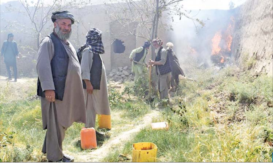
အဆိုပါ မီးလောင်မှုသည် ဩဂုတ် ၈ ရက်က စတင်လောင်ကျွမ်းခြင်းဖြစ်ပြီး ဖိုင်ဇာဘတ် ခရိုင်မှ ဘာလာမာဒီယန်ကျေးရွာကို လောင်မြိုက်သွားခဲ့ကြောင်း၊ တစ်နေ့လျှင် ငါးအိမ်မှ ခြောက်အိမ် အထိ အလုံးစုံ သို့မဟုတ် တစ်စိတ်တစ်ပိုင်း လောင်ကျွမ်းမှု ဖြစ်ပွားလျက်ရှိပြီး လက်ရှိအချိန်အထိ နေအိမ် ၁၂၀ မီးလောင်ပြာကျသွားပြီဖြစ်ကြောင်း ၎င်းက ဆက်ပြောသည်။ အဆိုပါ မီးလောင်မှုကို ထိန်းချုပ်နိုင်ခြင်း မရှိသေးကြောင်း သိရသည်။ ဆင်ပွား