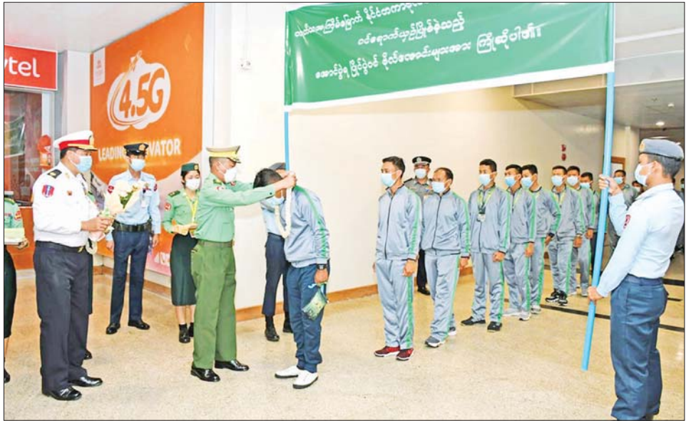
ရန်ကုန်တိုင်းစစ်ဌာနချုပ် တိုင်းမှူး ဗိုလ်ချုပ် ညွှန်ကြားရေးမှူးချုပ် တတိယအကြိမ်မြောက် နိုင်ငံတကာဗိုလ်လောင်း များ အားကစားပြိုင်ပွဲတွင် ဝင်ရောက်ယှဉ်ပြိုင်ခဲ့သည့် အောင်ပွဲရ ပြိုင်ပွဲဝင်ဗိုလ်လောင်းများအား ရန်ကုန် အပြည်ပြည်ဆိုင်ရာလေဆိပ်၌ ဂုဏ်ပြုကြိုဆိုစဉ်။

◆ ရှေ့ဖိုးမှ ဒုတိယဌေးတော်ဆိပ်ဆု၊ ပစ္စတိုသေနတ်ပစ် တိုက်ပွဲစစ်တပ် ခြင်းအသင်းလိုက်ပြိုင်ပွဲတွင် တတိယကြေးတံဆိပ် ဆုနှင့် ပစ္စတိုသေနတ်ပစ်အသင်းလိုက် အမြန်ပစ်စစ်တပ် အဆိုပါ တတိယအကြိမ်မြောက် နိုင်ငံတကာ ခြင်းပြိုင်ပွဲတွင် တတိယကြေးတံဆိပ်ဆု အသီးသီးရရှိ ခဲ့ပြီး ပြိုင်ပွဲဝင်နိုင်ငံပေါင်း ၂၀ ရှိသည့်အနက်တွင် နိုင်ငံအလိုက် အဆင့် ၈ နေရာ ရရှိခဲ့သည်။