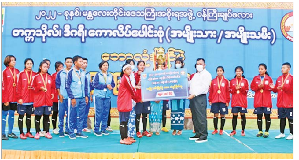
အားကစားသမား ဆုရရှိကြသူများကို ဆုတံဆိပ်နှင့် ငွေကျပ် တစ်သိန်းစီတို့ကို ချီးမြှင့်ပြီး မှတ်တမ်းတင် ဓာတ်ပုံရိုက်ကူးကာ အားကစားသမားများအား သတင်းစဉ်

တက္ကသိုလ်အသင်းက အစိုးရစက်မှုလက်မှုသိပ္ပံ (မန္တလေး) အသင်းကို ခုနစ်ဂိုးပြတ်ဖြင့် အနိုင်ရရှိခဲ့သည်။ ဆက်လက်၍ တိုင်းဒေသကြီး ဝန်ကြီးချုပ်က (ယာပုံ) ပထမဆုရ ရတနာပုံတက္ကသိုလ်အသင်းအား ဆုတံဆိပ်များ၊ တံခွန်စိုက်ဆုပေးလားနှင့် ငွေကျပ် ၁၅ သိန်း၊ အစိုးရအဖွဲ့ဝင်ဝန်ကြီးများနှင့် တာဝန်ရှိသူ များက ဒုတိယဆုရ အစိုးရစက်မှုလက်မှုသိပ္ပံ (မန္တလေး) အသင်းအား ဆုတံဆိပ်များနှင့် ငွေကျပ် ၁၅၀၀၀၀၊ ပူးတွဲတတိယဆုရ မန္တလားတက္ကသိုလ် အသင်းနှင့် မန္တလေးပညာရေးဒီဂရီကောလိပ် အသင်းတို့ကို ဆုတံဆိပ်များနှင့် ငွေကျပ် ၁၀ သိန်းစီ ဘောလုံးပြိုင်ပွဲ ပွဲစဉ်တစ်လျှောက် ဂိုးသမား အကောင်းဆုံးဆု၊ နောက်တန်းအကောင်းဆုံးဆု၊ အလယ်တန်းအကောင်းဆုံးဆု၊ ရှေ့တန်းအကောင်းဆုံးဆုနှင့် ပွဲစဉ်တစ်လျှောက် အကောင်းဆုံး