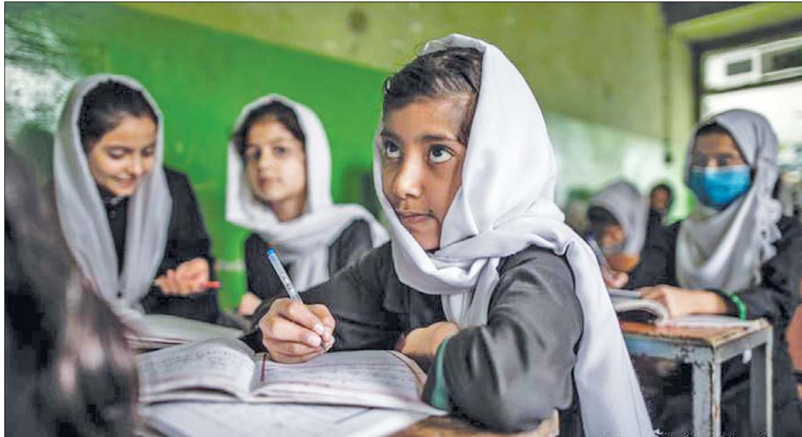
အာဖဂန်နစ္စတန်၌ စာသင်ကြားနေသည့် မိန်းကလေးငယ်များ။

၂၀၂၁ ခုနှစ် ဩဂုတ် ၁၅ ရက်မှာ တာလီဘန်တွေဟာ အာရှရက်ဖ်ဂါနီ အစိုးရကို ဖြုတ်ချလိုက်ပြီး နိုင်ငံအာဏာကို ရယူခဲ့ပါတယ်။ တစ်နှစ်ကြာပြီး နောက်မှာတော့ အာဖဂန်နစ္စတန်နိုင်ငံဟာ ကမ္ဘာက အာရုံစိုက်တဲ့ စိန်ခေါ်မှုပေါင်းများစွာနဲ့ ရင်ဆိုင်နေရပါတော့တယ်။