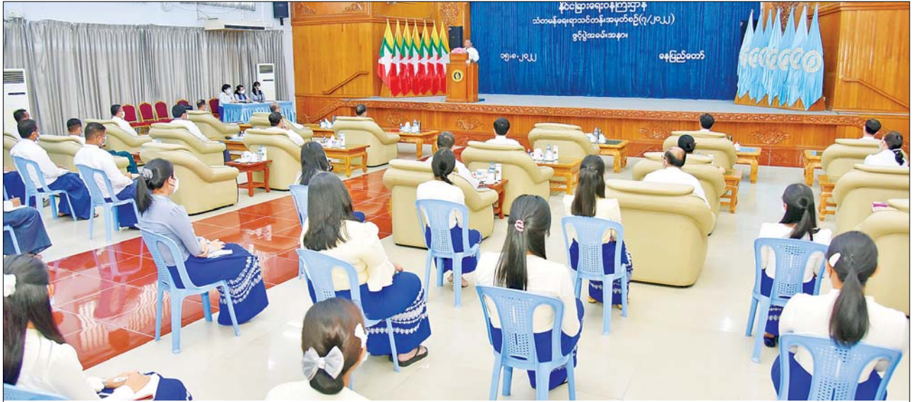
ပြည်ထောင်စုဝန်ကြီး ဦးဝဏ္ဏမောင်လွင် သံတမန်ရေးရာသင်တန်း (Course in Diplomacy - CID) အမှတ်စဉ် (၇/၂၀၂၂) သင်တန်း ဖွင့်ပွဲ အခမ်းအနားတွင် အမှာစကားပြောကြားစဉ်။

သင်ကြားပို့ချသွားမည့် သင်တန်းတွင် သံတမန်ရေးရာ ထမ်းငယ်များ၏ အရည်အသွေး မြှင့်တင်ရန်နှင့် ဘာသာရပ်ဆိုင်ရာ ဗဟုသုတကြွယ်ဝစေရန်အတွက် နိုင်ငံခြားရေးမူဝါဒ၊ မျက်မှောက်ခေတ် နိုင်ငံတကာရေးရာများ၊ ကုလသမဂ္ဂနှင့် အပြည်ပြည်ဆိုင်ရာဥပဒေများ၊ နိုင်ငံတကာနှင့် ဒေသတွင်း အဖွဲ့အစည်းများ ဆိုင်ရာကိစ္စရပ်များ၊ နိုင်ငံတကာ