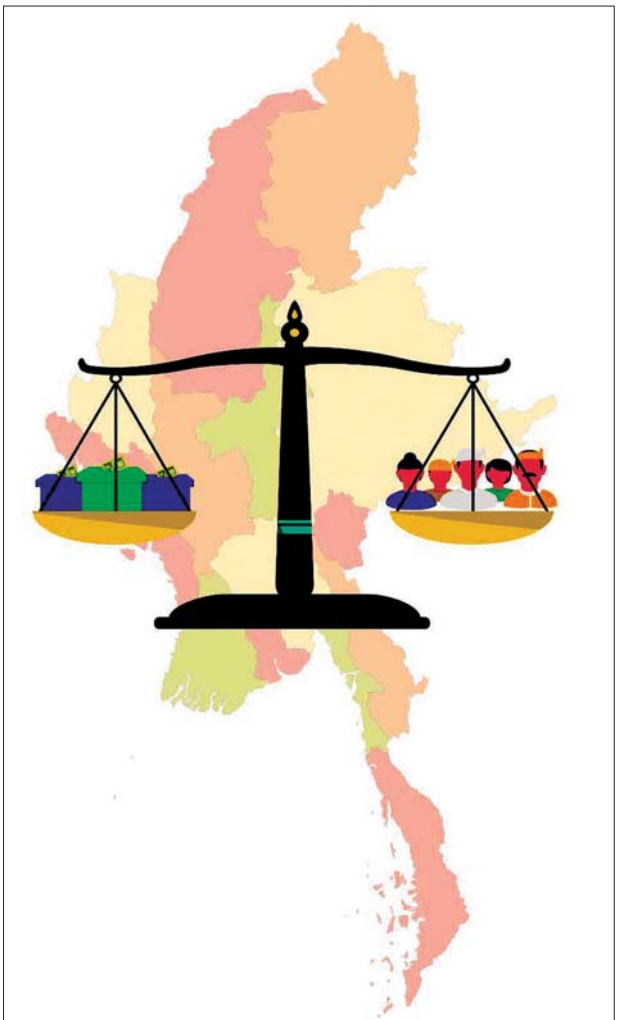
အချိုးကျကိုယ်စားပြုစနစ် ( Proportional Representation - PR )

အချိုးကျကိုယ်စားပြုစနစ် ( PR ) ဆိုသည်မှာ တစ်ဦးထက်ပိုသော ကိုယ်စားလှယ်များ ရွေးကောက်တင်မြှောက်ရန်အတွက် မဲဆန္ဒနယ်ကို ဧရိယာကျယ်ပြန့်စွာ သတ်မှတ်၍ ယင်းမဲဆန္ဒနယ်မှ ရွေးကောက် တင်မြှောက်ရမည့် ကိုယ်စားလှယ်ဦးရေကိုပါ သတ်မှတ်ပေးပြီး ပါတီ အဖွဲ့အစည်းအလိုက် ယှဉ်ပြိုင်စေခြင်းဖြစ်သည်။ ရွေးကောက်ပွဲတွင် ပါတီအဖွဲ့အစည်းအလိုက်ရရှိသည့် ထောက်ခံဆန္ဒမဲအပေါ် မူတည်၍ ရွေးကောက်ခံရသည့် ကိုယ်စားလှယ်ဦးရေကို သတ်မှတ်ပေးသည့် စနစ်လည်း ဖြစ်သည်။ ယင်းစနစ်အရ တစ်သီးပုဂ္ဂလများလည်း ပါဝင် ယှဉ်ပြိုင်နိုင်ပြီး ရရှိသော ထောက်ခံဆန္ဒမဲအပေါ် မူတည်ပြီး ရွေးကောက်တင်မြှောက်ခံရနိုင်သည်။ အချိုးကျကိုယ်စားပြုစနစ်ကို ယေဘုယျအားဖြင့် အောက်ပါအတိုင်း သုံးမျိုးခွဲခြားနိုင်သည် -