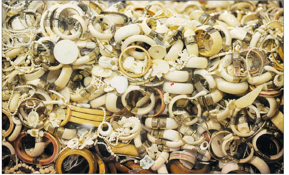
ဆင်စွယ်နှင့် တောရိုင်းတိရစ္ဆာန်ထွက်ပစ္စည်းများဖြင့် ပြုလုပ်ထားသည့် လက်ဝတ်ရတနာနှင့်အလှဆင်ပစ္စည်းများကို တွေ့ရစဉ်။

သဘာဝသယံဇာတအရင်းအမြစ်များကို အလွန်အကျွံသုံးစွဲနေခြင်းသည် စားနပ်ရိက္ခာ၊ စွမ်းအင်နှင့် ဝင်ငွေရရှိရေးအတွက် တောရိုင်းတိရစ္ဆာန်များအပေါ် မှီခိုနေရသည့် ကမ္ဘာပေါ်ရှိ ဘီလီယံပေါင်းများစွာသော လူသားများ၏ ရေရှည်ရှင်သန်ရပ်တည်ရေးအတွက် ခြိမ်းခြောက်မှုတစ်ခုပင်ဖြစ်ကြောင်း ကုလသမဂ္ဂဇီဝမျိုးစုံမျိုးကွဲများဆိုင်ရာပညာရှင်များက သတိပေးထားသည်။