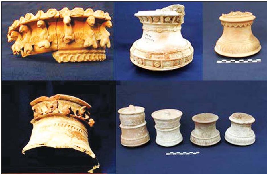
ကုန်းအမှတ်-၃၄ (BTO-34) မှ တူးဖော်ရရှိသော မြေအရိုးအိုးများ