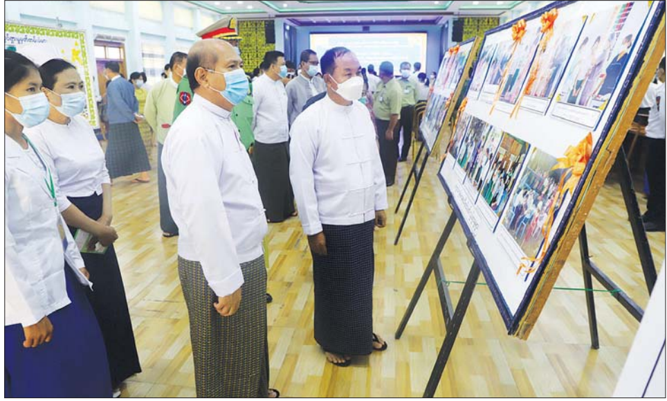
စစ်ကိုင်းတိုင်းဒေသကြီးဝန်ကြီးချုပ် ကျောင်းကျန်းမာရေးသီတင်းပတ် အထိမ်းအမှတ်လှုပ်ရှားမှုပြခန်း အတွင်း ခင်းကျင်းပြထားသော ကျောင်းကျန်းမာရေးလှုပ်ရှားမှုဓာတ်ပုံများအား ကြည့်ရှုစဉ်။

မုံရွာ ဩဂုတ် ၁၅ စစ်ကိုင်းတိုင်းဒေသကြီး ၂၀၂၂-၂၀၂၃ ပညာသင်နှစ် ကျောင်းကျန်းမာရေး သီတင်းပတ်အထိမ်းအမှတ် အခမ်းအနားကို ဩဂုတ် ၁၅ ရက်က တိုင်းဒေသကြီး အစိုးရအဖွဲ့ရုံးဝင်းအတွင်းရှိ ချင်းတွင်းခန်းမ၌ ကျင်းပရာ အခမ်းအနားသို့ တိုင်းဒေသကြီးဝန်ကြီးချုပ် ဦးမြတ်ကျော်၊ တိုင်းဒေသကြီး တရားသူကြီးချုပ်၊ တိုင်းဒေသကြီး အစိုးရအဖွဲ့ဝင်များ၊ တိုင်းဒေသကြီး/ခရိုင်/မြို့နယ်အဆင့် ဌာနဆိုင်ရာများ၊ ကျန်းမာရေးဝန်ထမ်းများ၊ ပညာရေးဝန်ထမ်းများ၊ ကျောင်းသား ကျောင်းသူများနှင့် တာဝန်ရှိသူများ တက်ရောက်ကြသည်။