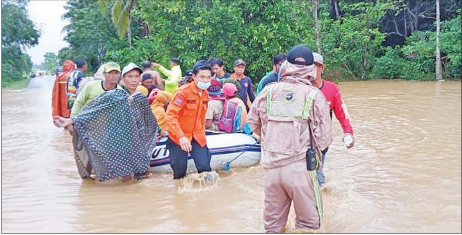
လာအိုနိုင်ငံ၌ ရေကြီးမှုကြောင့် ကယ်ဆယ်ရေးလုပ်ငန်းများဆောင်ရွက်နေသည်ကို တွေ့ရစဉ်။

ဗီယင်ကျွန်း၊ ဩဂုတ် ၁၅ လာအိုနိုင်ငံ မြောက်ပိုင်းဒေသများတွင် ရက်အတန်ကြာ မိုးသည်းထန်စွာ ရွာသွန်းမှုကြောင့် မြစ်ကြီးမူဖြစ်ပွားရာ ဒေသခံထောင်နှင့်ချီ၍ ရေဘေးသင့်ခဲ့ကြောင်း သိရသည်။ ခရိုင် ၁၀ ခုထက်မနည်း ရေကြီးမှုဖြစ်ပွားခဲ့ပြီး ဆာရာဘိုရီ၊ ဟုပင်၊ လွမ်ပရာဘန်နှင့် ဗီယင်ကျွန်း ပြည်နယ်တို့တွင် လည်း ရေကြီးမှုဖြစ်ပွားခဲ့ကြောင်း သိရသည်။