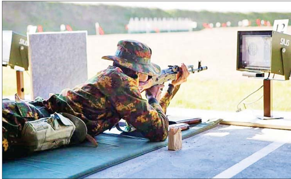
ရုရှားဖက်ဒရေးရှင်းနိုင်ငံတွင် ကျင်းပပြုလုပ်သည့် တတိယအကြိမ်မြောက် နိုင်ငံတကာဗိုလ်လောင်းများ အားကစားပြိုင်ပွဲ (3 rd CISM World Cadet Games) တွင် မြန်မာ့တပ်မတော်မှ ဗိုလ်လောင်း ရိုင်ဖယ် သေနတ်ပစ် တစ်ဦးချင်း အမြန်ပစ်ခြင်းပြိုင်ပွဲတွင် ပါဝင်ယှဉ်ပြိုင်စဉ်။

ဆက်ဆံရေး ဘာသာရပ်များ၊ နိုင်ငံသားအကျိုး ကာကွယ် များနှင့် လက်တွေ့အသုံးချ လက်တွေ့ ရက်သတ္တ ၁၂ပတ်ကြာ သံတမန်ရေးရာများ၊ ကောင်စစ် စောင့်ရှောက်ခြင်းဆိုင်ရာ ကိစ္စရပ် အင်္ဂလိပ်စာ ကျွမ်းကျင်ရေး သင်ကြား ပို့ချသွားမည်ဖြစ် ရေးရာနှင့် ဥပဒေရေးရာများ၊ များ၊ စီးပွားရေးဆိုင်ရာဘာသာရပ် ဘာသာရပ်များကို စာတွေ့ ကြောင်း သိရသည်။ သတင်းစဉ်