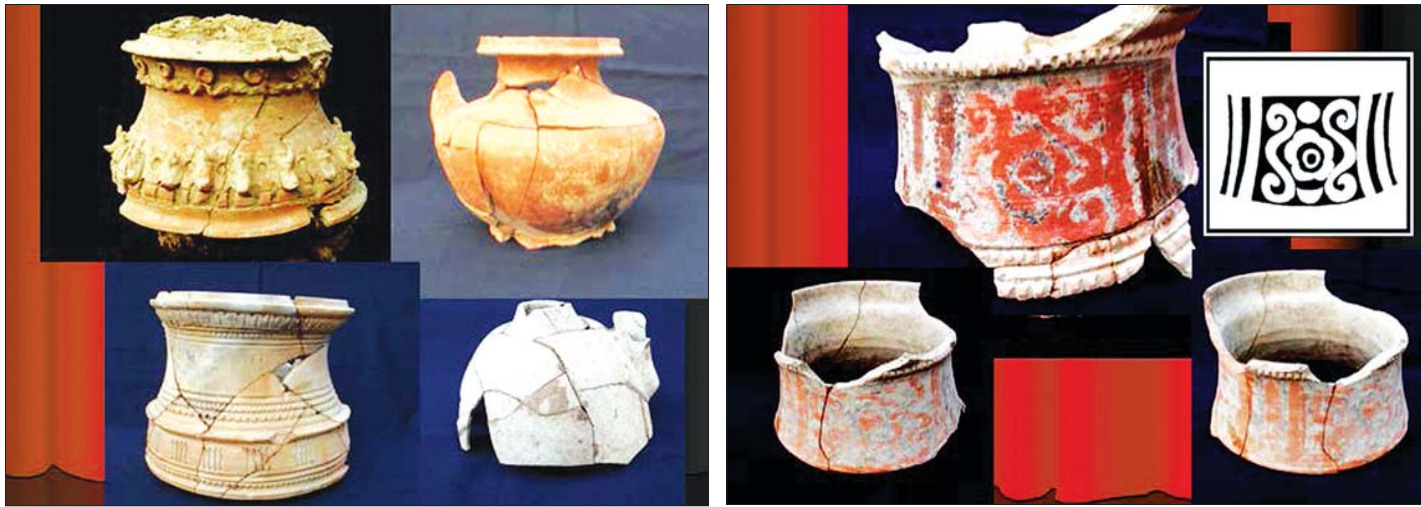
ကုန်းအမှတ်-၃၂ (BTO-32) မှ ရရှိသော အရိုးအိုးများနှင့် ဆေးရေးခြယ်ထားသောအိုး (Painted Pottery)

ကုန်းအမှတ်-၃၃ (BTO-33) သည် အိုးထိန်း တောင်၏အရှေ့ဘက် အိုးထိန်းတောင်ရှိ ကုန်း အမှတ်-၃၀ (BTO-30) နှင့် အရှေ့ဘက်သို့ တစ်တန်းတည်းနီးပါးတည်ရှိပြီး ကြားတွင် အိုးထိန်း တောင် ရေကန်ငယ်တစ်ခု ရှိသည်။ အိုးထိန်း တောင်ကန်၏ အရှေ့ဘက်ကုန်းစောင်းတွင် ထိုကုန်း ကို တွေ့ရှိရသည်။ ကုန်းအမှတ်- ၃၃ (BTO-33) ကို တူးဖော်ရာမှထွက်ရှိလာသော အဆောက်အဦမှာ အရှေ့မှ အနောက်သို့ အလျား ၄၇ ပေ ၆ လက်မ နှင့် တောင်မြောက် အနံ ၄၁ ပေရှိသော စတုဂံပုံ မကျတကျ အဆောက်အဦကြီး ဖြစ်ပါသည်။ ကုန်းအမှတ် - ၃၃ (BTO-33) ၏ အဆောက် အဦပန္နက်ပုံသည် အိုးထိန်းတောင်အရှေ့ဘက်ရှိ ကုန်းအမှတ် - ၃၀ (BTO-30) အဆောက်အဦ၏ ပန္နက်ပုံနှင့် အဝင်ခန်းမကြီး၏ ဘေးနှစ်ဖက်တွင် အခန်းငယ် နှစ်ခန်းဖွဲ့စည်းပါဝင်မှု မရှိသည်ကလွဲ၍ တစ်ထောင့်တည်းတူညီလျက်ရှိကြောင်း တွေ့ရှိရပါ သည်။ ထို့ပြင်ထိုအဆောက်အဦ နှစ်ခုမှာ အိုးထိန်း တောင်ရေကန်၏ နဖူးပေါ်တွင်မေးတင်၍ တစ်တန်း တည်း တည်ဆောက်ထားကြောင်း တွေ့ရှိ ရသည်။