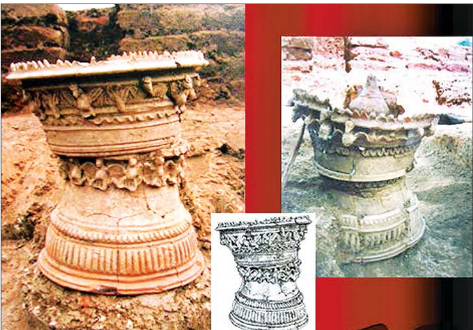
ကုန်းအမှတ် - ၂၀ (BTO-20) တူးဖော်မှုမှ ပေါ်ထွက်လာသော ပျူအရိုးအိုးများ

သိကြားမင်းက ထိုမိန်းမငယ်သည် ကဿပမြတ်စွာဘုရားလက်ထက်က လက်ယာတော်ရံအရင်မြတ်အား ပေရွက်ယပ်တောင်လျှူဒါန်းခဲ့ဖူးသည်။ ထိုသို့ လျှူဒါန်းခဲ့ဖူးသော အကျိုးကြောင့် ထိုမိန်းမငယ်၏ ဖြစ်လေရာဘဝတိုင်းတွင် မစိုက်မပျိုးရာဘဲ ပေပင်တို့ ပေါက်ရောက်ခြင်းသော ကနက်ထီးနန်းတွင် စံမြန်းရလိုကြောင်း ပန်ထွာဆုတောင်းခဲ့ဖူးလေသည်။ ယခုအခါတွင် ထိုသို့ဆုတောင်းခဲ့သော ကုသိုလ်ကံ၏ အကျိုးပေးရန် အချိန်ရောက်ပြီဖြစ်ကြောင်း မိန့်ကြားလိုက်သည်။ ထိုအခါ ဗိဿနိုးနတ်မင်းက အိုးများကို မကွဲမပျက်နိုင်အောင် စီမံ၍ တောင်ငယ်မဟာဏဂျီအိုးတစ်သိန်းအဖြစ် ဖန်ဆင်းပုံပေးထားလေသည်။ ထိုအရပ်ကို အိုးသိန်းတောင်ဟု