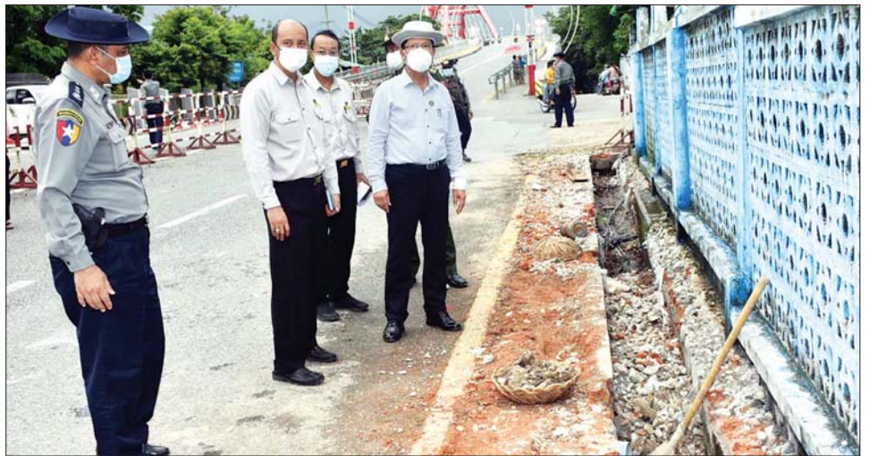
ဘဏ္ဍာနှစ်အတွင်း အချိန်မီပြီးစီးရေးအပြင် စံချိန်စံညွှန်းနှင့် အရည်အသွေးကောင်းမွန်ရေးတို့အား အလေးထားဆောင်ရွက်ရေး၊ ရေလမ်းကြောင်းအသင့်ထားရှိရေးတို့ကို မှာကြားခဲ့သည်။ တိုင်းဒေသကြီး (ပြန်/ဆက်)

များသို့ ဆက်လက်သွားရောက်၍ စုပေါင်းသန့်ရှင်းရေးဆောင်ရွက်နေမှုများကို ကြည့်ရှုအားပေးသည်။ ဆက်လက်၍ တိုင်းဒေသကြီး ဝန်ကြီးချုပ်သည် ပုသိမ်မြို့ကမ်းနားလမ်းတစ်လျှောက် သန့်ရှင်းသာယာလှပစေရန် ပြင်ဆင်ဆောင်ရွက်ထားမှုနှင့် ပုသိမ်မြစ် ရေလမ်းကြောင်းတိုးတက်ရေးဆိုင်ရာ လုပ်ငန်းများကို သင်္ဘောဖြင့် မြစ်ကြောင်းတစ်လျှောက် လှည့်လည်ကြည့်ရှုစစ်ဆေးရာ တိုင်းဒေသကြီး မြန်မာ့ဆိပ်ကမ်းအာဏာပိုင်နှင့် တိုင်းဒေသကြီး ရေအရင်းအမြစ်နှင့် မြစ်ချောင်းများ ဖွံ့ဖြိုးတိုးတက်ရေးဦးစီးဌာနမှူးတို့က ဘဏ္ဍာနှစ်အလိုက် ကမ်းနားလမ်း တိုးချဲ့ဆိပ်ခံတံတား (Jetty) တည်ဆောက်ခြင်းနှင့် ပုသိမ်မြစ်ရေလမ်းကြောင်း တိုးတက်ရေးဆိုင်ရာ လုပ်ငန်းများ၏ ဆောင်ရွက်ပြီး၊ ဆောင်ရွက်ဆဲနှင့် ဆက်လက်ဆောင်ရွက်မည့် လုပ်ငန်းအစီအမံများ ရှင်းလင်းတင်ပြကြသည်။ ထို့နောက် တိုင်းဒေသကြီးဝန်ကြီးချုပ်က ဆိပ်ခံတံတားတည်ဆောက်ရာတွင် သတ်မှတ်ထားသော