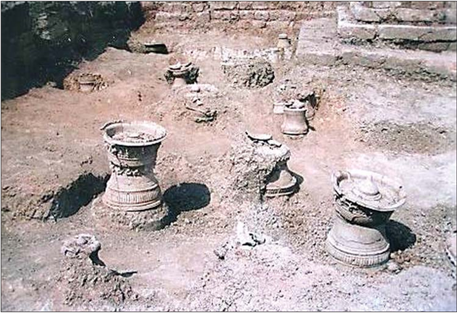
ကုန်းအမှတ် - ၂၀ (BTO-20) တူးဖော်မှုမှ ပေါ်ထွက်လာသော ပျူအရိုးအိုးများ

ဗိဿနိုးမြို့ဟောင်းဟုဆိုလျှင် ရှေးပူရာဏကျမ်းများအရ ဒုက္ခဘောင်မင်းကြီး၊ ပန်ထွာမင်းသမီး (ဗိဿနိုးဘုရင်မ)၊ သိကြားပေးသော အတုလ စည်တော်ကြီးနှင့် ရန်ပယ်ချောင်းတို့၏ ဒဏ္ဍာရီကို ဆက်စပ်သိရှိကြပါသည်။ ထိုဗိဿနိုးမြို့ဟောင်းသည် မြန်မာနိုင်ငံတွင် ထင်ရှားသော ရှေးဟောင်းလူမျိုးတို့၏ မြို့တော်များအနက် ရှေးကျသော ပျူမြို့တော်တစ်ခုဖြစ်ကြောင်း ရှေးဟောင်းသုတေသနဦးစီးဌာန၏ တူးဖော်သုတေသနပြုမှုများက သက်သေပြခဲ့ပြီး ဖြစ်ပါသည်။