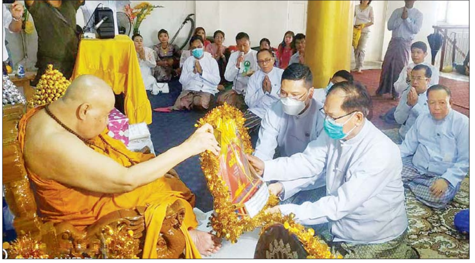
အာဟာရဒါန ထမင်းထုပ်၊ ဟင်းထုပ်များ ပေးကမ်း ဖျော်ဖြေတင်ဆက်ခြင်းများ ကုသိုလ်ပြုလုပ်သွားလှူဒါန်းခြင်း၊ ကံစမ်းမဲများဖောက်ခြင်းနှင့် ရခိုင် မည်ဖြစ်ကြောင်း သိရသည်။ အဆိုတော်တေးသံရှင်များက တေးဂီတများဖြင့် တင်ထွန်း(ပြန်/ဆက်)

ကြသည်။ ထို့နောက်ပြည်နယ်ဝန်ကြီးချုပ်၊ ပြည်နယ်ဝန်ကြီးများ၊ ပြည်နယ်ဥပဒေချုပ်၊ အစိုးရအဖွဲ့အတွင်း ရေးမှူးနှင့် တာဝန်ရှိသူများ၊ အလှူရှင်များက ဆရာတော်ကြီးထံ လှူဖွယ်ဝတ္ထုပစ္စည်းများ ဆက်ကပ်လှူဒါန်းကြသည်။ ဆရာတော်ကြီး၏ သက်တော် (၇၅)နှစ်ပြည့် စိန်ရတုဝိဇာတမင်္ဂလာပွဲတော်တွင် သံဃာတော် (၇၆)ပါးတို့အား ဆွမ်းနှင့်လှူဖွယ်ဝတ္ထုများ ဆက်ကပ်လှူဒါန်းခြင်း၊ လူပေါင်း ၄၀၀၀ ကျော်တို့အား