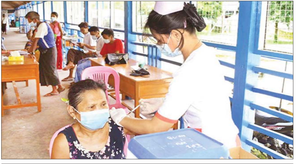
လျှပ်စစ်ကိုချွေတာသုံးစွဲခြင်းဖြင့် မိတာခများများ ကျသင့်ခြင်းမှ ရှောင်ရှားပါ

တပ်မတော်မှ ဆေးအဖွဲ့များ၊ ကျောင်းသူများကိုလည်း ကိုဗစ်-၁၉ ရောဂါ ကာကွယ်ဆေးများ ထိုးနှံပေးလျက်ရှိရာ ဩဂုတ် ၁၄ ရက်နှင့် ယနေ့တို့တွင် ရခိုင်ပြည်နယ် ဘူးသီးတောင်မြို့နယ်နှင့် ကျောက်ဖြူမြို့နယ်တို့၌ ဆောင်ရွက်ပေးလျက်ရှိသည်။ ထိုသို့ ဆောင်ရွက်လျက်ရှိရာ ဩဂုတ် ၁၄ ရက်နှင့် ယနေ့တို့တွင် ဧရာဝတီတိုင်းဒေသကြီးအတွင်းရှိ မြို့နယ် ၂၆ မြို့နယ်တို့၌ ဒေသခံပြည်သူ ၁၇၈၁ ဦး၊ ရခိုင်ပြည်နယ် ကျောက်ဖြူမြို့နယ်နှင့် သံတွဲမြို့နယ်တို့၌ ဒေသခံပြည်သူ ၃၉၂ ဦး၊ မန္တလေးတိုင်းဒေသကြီးအတွင်းရှိ ခရိုင်ခုနစ်ခုတို့မှ ဒေသခံပြည်သူ ၅၄၁၃ ဦးတို့ကို တပ်မတော်မှ ဆေးအဖွဲ့များက ပြည်သူ့ဆေးရုံများမှ ဆရာဝန်များ၊ သက်ဆိုင်ရာ ကျန်းမာရေးဝန်ထမ်းများ၊ စေတနာ့ဝန်ထမ်းများနှင့် ပူးပေါင်း၍ ကိုဗစ်-၁၉ ရောဂါ ကာကွယ်ဆေး ထိုးနှံပေးခြင်းများ ဆောင်ရွက်ပေးသည်။ ယင်းသို့ ဆောင်ရွက်ပေးနေမှုများကို သက်ဆိုင်ရာ တိုင်းဒေသကြီးနှင့် ပြည်နယ်များမှ တာဝန်ရှိသူများက သွားရောက်ကြည့်ရှုအားပေးပြီး လိုအပ်သည်များ ညှိနှိုင်း ဆောင်ရွက်ပေးခဲ့ကြကြောင်း သိရသည်။ သတင်းစဉ်