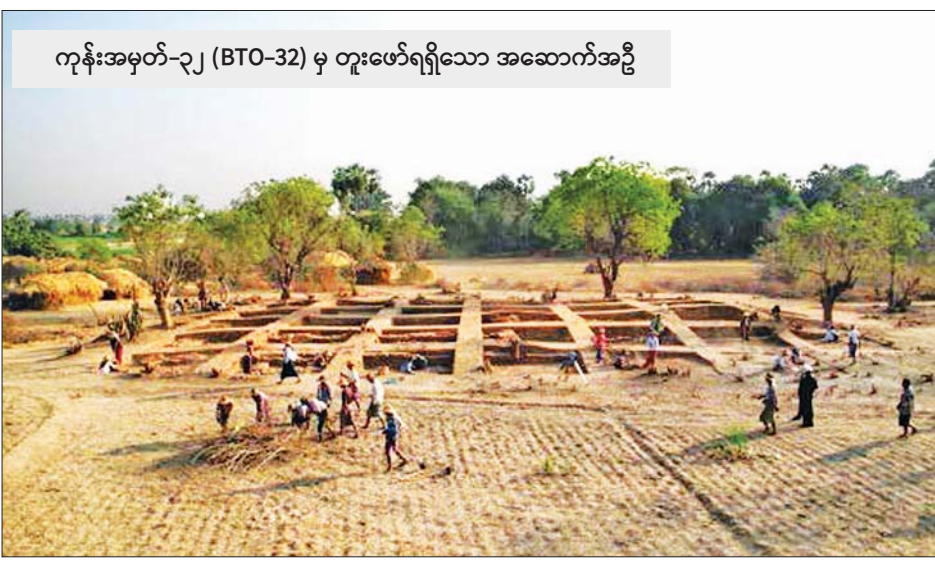
ကုန်းအမှတ်-၃၂ (BTO-32) မှ တူးဖော်ရရှိသော အဆောက်အဦ

ကုန်းအမှတ်-၃၀ တူးဖော်မှု ကုန်းအမှတ်-၃၀ (BTO-30) သည် အိုးထိန်း တောင်ဒေသ အလယ်နေရာရှိ စေတီကြီးကုန်း အမှတ်-၁၈ (KKG-18) မှ အရှေ့တောင်ဘက် ကိုက် ၇၀ အကွာတွင် တည်ရှိသည်။ အိုးထိန်းတောင်ကုန်း ၏ အရှေ့တောင်ဘက်အစွန် မြေခိုမိပိုင်းနေရာတွင် တည်ရှိသည်။ ကုန်း၏ အရှေ့ဘက်တွင် အိုးထိန်း