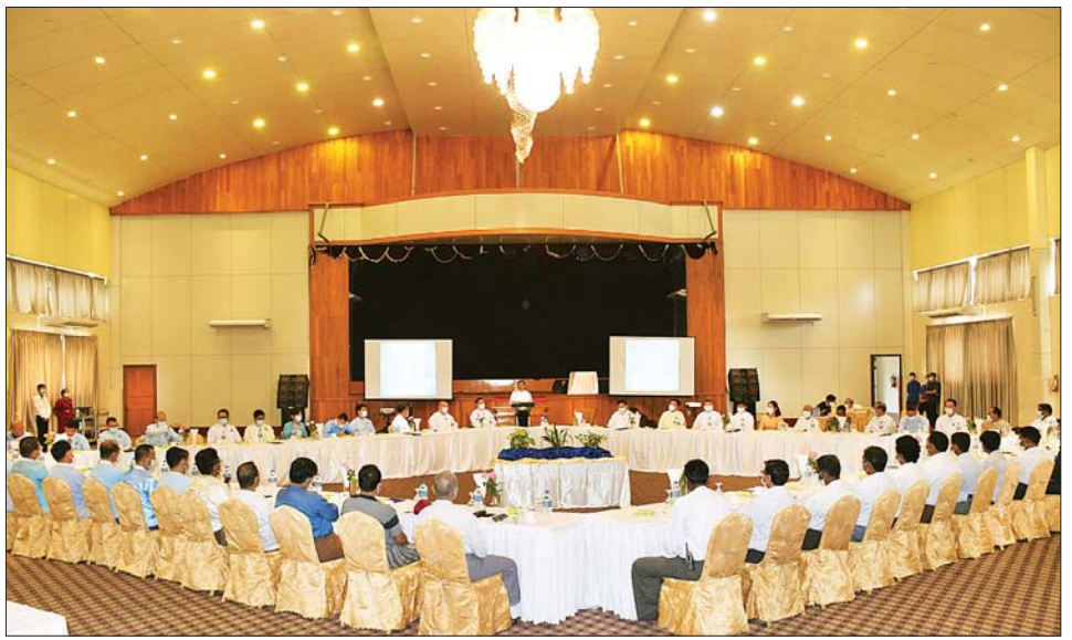
ဆောင်ရွက်ရာ တာဝန်ရှိ သူများက လက်ခံရယူကြပြီး နေပြည်တော် ဘာသာပေါင်းစုံချစ်ကြည်ညီညွတ်ရေးအဖွဲ့ ဥက္ကဋ္ဌ ဦးအောင်ချိုက ကျေးဇူးတင်စကား ပြန်လည်ပြောကြားသည်။ ရှင်းလင်းပြောကြား ယင်းနေ့က ဒုတိယဝန်ကြီးနှင့် တာဝန်ရှိသူများက အခမ်းအနားသို့ တက်ရောက်လာကြသည့် ဘာသာပေါင်းစုံ ချစ်ကြည်ညီညွတ်ရေးအဖွဲ့များမှ တာဝန်ရှိသူများကို ရင်းရင်းနှီးနှီး တွေ့ဆုံနှုတ်ဆက်ခဲ့ကြောင်း သိရသည်။ ဇော်မင်းလွင် (မြို့နယ်ပြန်/ဆက်)

ဖြစ်ပါကြောင်း ပြောကြားသည်။ ပူးပေါင်းပါဝင်ဆောင်ရွက် ထိုနေ့က နေပြည်တော်ကောင်စီအဖွဲ့ဝင် ဦးမြင့်စိုးက ယခုဖွဲ့စည်းလိုက်သည့် နေပြည်တော် ဘာသာပေါင်းစုံချစ်ကြည် ညီညွတ်ရေးအဖွဲ့အနေဖြင့် ဘာသာသာသနာ ထိန်းသိမ်းစောင့်ရှောက်ရေး လုပ်ငန်းများတွင် ပူးပေါင်းဆောင်ရွက်မှုများနှင့် အတူ နိုင်ငံတော်ဖွံ့ဖြိုးတိုးတက်ရေး ဆောင်ရွက်မှုများတွင် တစ်တပ်တစ်အား ပူးပေါင်းပါဝင်ဆောင်ရွက်ကြ စေလိုကြောင်း ပြောကြားသည်။ ရှင်းလင်းပြောကြား ယင်းနေ့က ပြည်ထောင်စုသမ္မတမြန်မာနိုင်ငံတော် ဘာသာပေါင်းစုံချစ်ကြည်ညီညွတ်ရေးအဖွဲ့ (ဗဟို) ဥက္ကဋ္ဌ ဦးစိန်သန်းက ဘာသာပေါင်းစုံချစ်ကြည် ညီညွတ်ရေးအဖွဲ့ အသစ်ပြန်လည်ဖွဲ့စည်းခြင်းနှင့် စပ်လျဉ်း၍ ရှင်းလင်းပြောကြားသည်။ ခန့်အပ်လွှာများပေးအပ် ထိုနေ့က သာသနာရေးနှင့်ယဉ်ကျေးမှုဝန်ကြီးဌာန ဒုတိယဝန်ကြီးနှင့် တာဝန်ရှိသူများက ပြည်ထောင်စုနယ်မြေ ဘာသာပေါင်းစုံချစ်ကြည် ညီညွတ်ရေးအဖွဲ့ နာယကကြီးများနှင့် အလုပ်အမှု