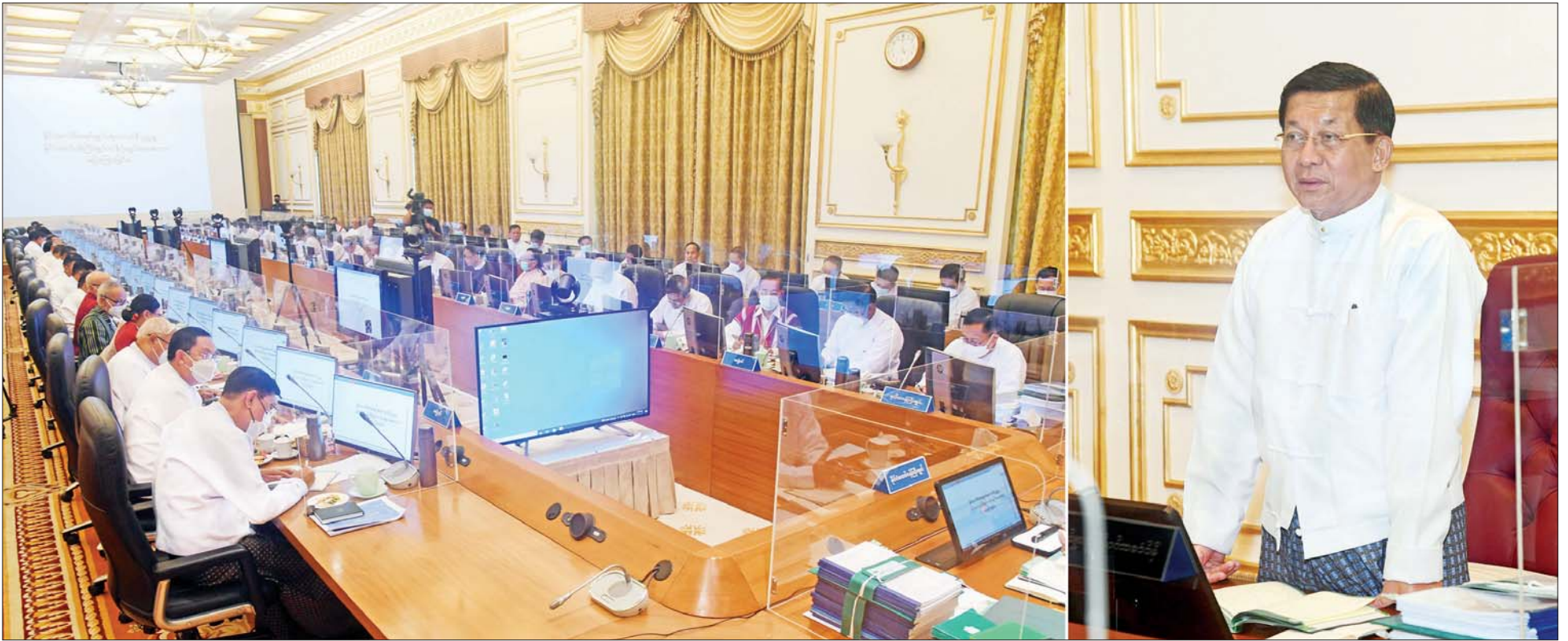
နိုင်ငံတော်စီမံအုပ်ချုပ်ရေးကောင်စီဥက္ကဋ္ဌ နိုင်ငံတော်ဝန်ကြီးချုပ် ဗိုလ်ချုပ်မှူးကြီး မင်းအောင်လှိုင် ပြည်ထောင်စုအစိုးရအဖွဲ့ လုပ်ငန်းဆောင်ရွက်ချက်များနှင့်စပ်လျဉ်းသည့် ညှိနှိုင်းအစည်းအဝေး တတိယနေ့တွင် လိုအပ်သည်များကို လမ်းညွှန်မှာကြားစဉ်။

၄။ တစ်နိုင်ငံလုံး ထာဝရငြိမ်းချမ်းရေးရရှိရေးအတွက် တစ်နိုင်ငံလုံး ပစ်ခတ်တိုက်ခိုက်မှုရပ်စဲရေး သဘောတူစာချုပ် (NCA) ပါ သဘောတူညီချက်များအတိုင်း ဖြစ်နိုင်သမျှ အလေးထား လုပ်ဆောင်သွားမည်။ ၅။ အရေးပေါ်ကာလဆိုင်ရာ ပြဋ္ဌာန်းချက်များနှင့်အညီ ဆောင်ရွက်ပြီးစီးပါက ဖွဲ့စည်းပုံအခြေခံဥပဒေ (၂၀၀၈ ခုနှစ်)နှင့်အညီ လွတ်လပ်ပြီး တရားမျှတသော ပါတီစုံဒီမိုကရေစီ အထွေထွေရွေးကောက်ပွဲအား ပြန်လည်ကျင်းပ၍ အနိုင်ရသည့်ပါတီအား ဒီမိုကရေစီစံနှုန်းများနှင့်အညီ နိုင်ငံတော်တာဝန်အား လွှဲအပ်နိုင်ရေး ဆက်လက်ဆောင်ရွက်သွားမည်။