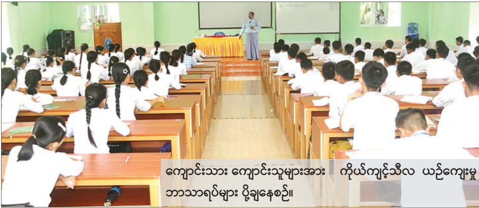
ကျောင်းသား ကျောင်းသူများအား ကိုယ်ကျင့်သီလ ယဉ်ကျေးမှု ဘာသာရပ်များ ပို့ချနေစဉ်။

ထိုတိုင်းရင်းသား လူငယ်ကလေးများသည် ပညာရေးဝန်ကြီးဌာနမှ တက္ကသိုလ်၊ ဒီဂရီကောလိပ်