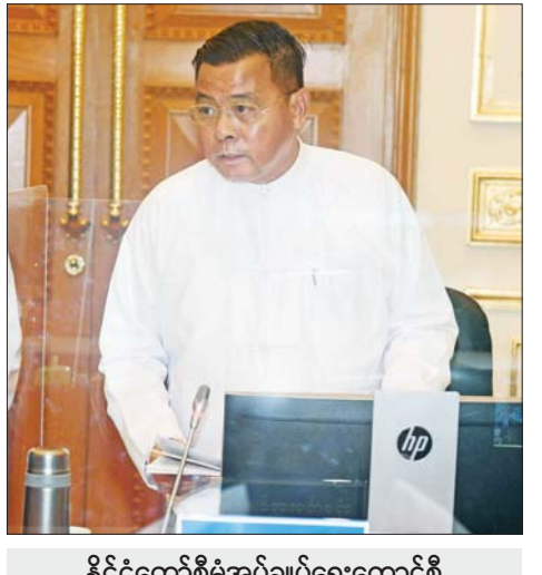
နိုင်ငံတော်စီမံအုပ်ချုပ်ရေးကောင်စီ တွဲဖက်အတွင်းရေးမှူး ဒုတိယဗိုလ်ချုပ်ကြီး ရဲဝင်းဦး ရှင်းလင်းတင်ပြစဉ်။

ဆောင်ရွက်ရန်လိုကြောင်း၊ ပြည်သူများ အထွေထွေ ဗဟုသုတ ကြွယ်ဝစေရန်အတွက် စာပေများ ဖတ်ရှု နိုင်ရေး တိုက်တွန်းနှိုးဆော်ဆောင်ရွက်ကြစေလို ကြောင်း။