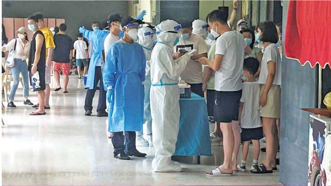
စန်ယအပန်းဖြေစခန်း၌ ကိုဗစ်-၁၉ ရောဂါပိုး ရှိ မရှိ စမ်းသပ်စစ်ဆေးသည့် နေရာ။

မြို့တော်ဝန်က ပြောပါတယ်။ အများစုမှာ တရုတ်လူမျိုးတွေဖြစ်ပြီး ရုန်ဟိုင်းကလည်း အများအပြား ပါဝင်တယ်လို့ ဆိုပါတယ်။ ဗြိတိန်လူမျိုး နယူတန်က ကိုဗစ်-၁၉ ရောဂါ ရှိ မရှိ စမ်းသပ်စစ်ဆေးဖို့အတွက် နံနက်တိုင်း နှစ်နာရီလောက် ထတန်းစီရတယ်လို့ ဆိုပါတယ်။ အဲဒီလို ထတန်းစီရတဲ့အတွက် အလုပ်နဲ့ ပတ်သက်တဲ့ အစည်းအဝေးတွေ ဖျက်သိမ်းရတယ်။ အဲဒီအခြေအနေက စိတ်မသက်သာဖြစ်တာကို ပိုပြီးမြင်သာစေပါတယ်။ အထူးသဖြင့် တိုးမြှင့်ကန့်သတ်ချက်တွေကို ခံစားရပြီးဖြစ်တဲ့ ရုန်ဟိုင်းကလူတွေအတွက် ပိုပြီးဆိုးတယ်