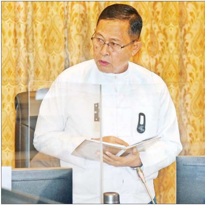
နိုင်ငံတော်စီမံအုပ်ချုပ်ရေးကောင်စီ ဒုတိယဥက္ကဋ္ဌ ဒုတိယဝန်ကြီးချုပ် ဒုတိယ ဗိုလ်ချုပ်မှူးကြီး စိုးဝင်း ဖြည့်စွက်ဆွေးနွေးစဉ်။

တိုက်တွန်းနှိုးဆော်ဆောင်ရွက် ရှင်းလင်းတင်ပြမှုများအပေါ် နိုင်ငံတော်စီမံ အုပ်ချုပ်ရေးကောင်စီဥက္ကဋ္ဌ နိုင်ငံတော်ဝန်ကြီးချုပ်က ကဏ္ဍတစ်ခုချင်းအလိုက် ပြန်လည်သုံးသပ်ဆွေးနွေး ရာတွင် ပြန်ကြားရေးလုပ်ငန်းများ ဆောင်ရွက်ရာ၌ သတင်းများမှန်ကန်ရန်နှင့် မြန်ဆန်ရန် လိုအပ် ကြောင်း၊ သတင်းမှန်များကို ပြည်သူများသိရှိစေရေး အချိန်နှင့်တစ်ပြေးညီ ထုတ်ပြန်နိုင်ရန်လိုကြောင်း၊ မြန်မာ့ရိုးရာ ဂီတနှင့် အနုပညာယဉ်ကျေးမှုများကို ထိန်းသိမ်းရန် ကျင်းပပြုလုပ်မည့် အဆို၊ အက၊ အရေး၊ အတီးပြိုင်ပွဲများကိုလည်း တိုင်းဒေသကြီး နှင့် ပြည်နယ်အားလုံးမှ ပါဝင်ယှဉ်ပြိုင်နိုင်ရေး