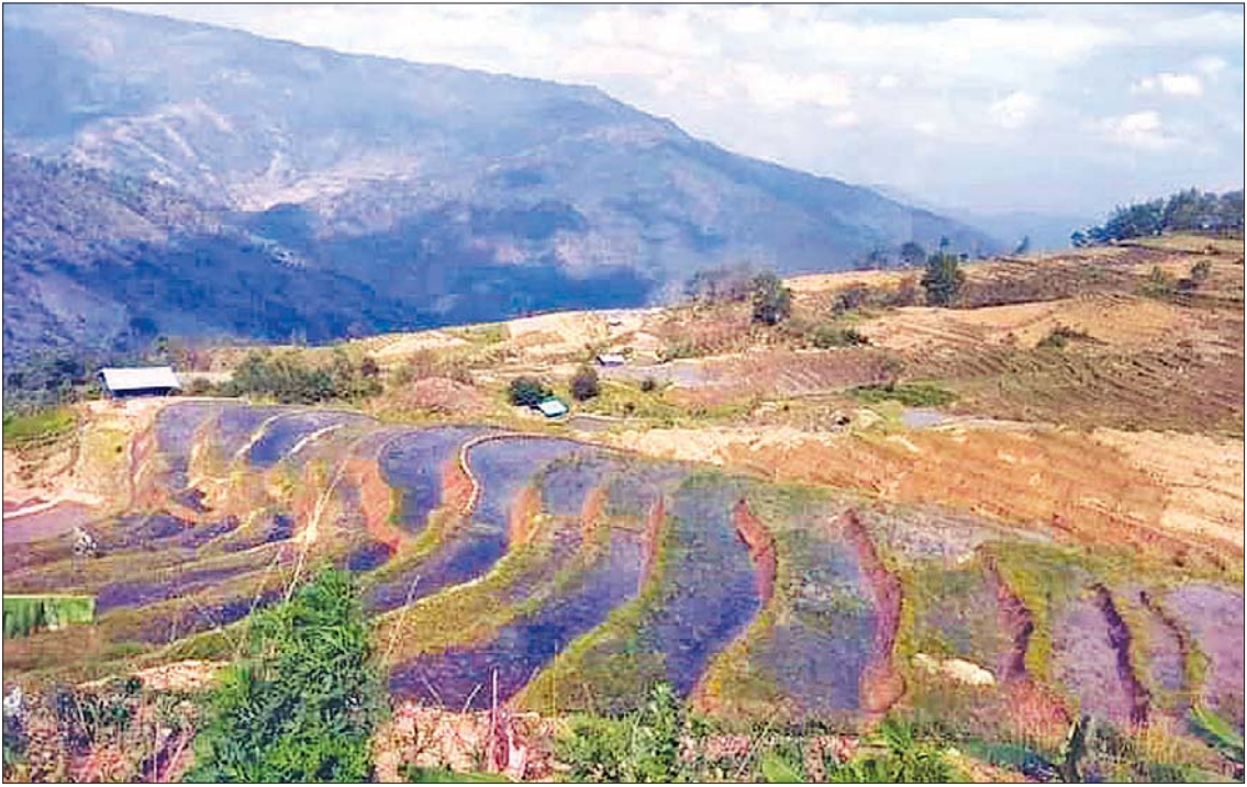
နာဂဒေသ လဟယ်မြို့နယ်တွင် လှေကားထစ်လယ်ယာဖော်ဆောင်မှုကို တွေ့ရစဉ်။

ဘက်စုံဖွံ့ဖြိုးတိုးတက်ရေး ပူးပေါင်းဆောင်ရွက်လျက်ရှိ နာဂဒေသသည် တောင်ကုန်းတောင်တန်းများ ထူထပ်ပေါများကာ မြေပြန့်ဒေသနည်းပါးပြီး လမ်းပန်းဆက်သွယ်ရေးခက်ခဲကာ ဒေသခံများ အနေဖြင့်လည်း တောင်ယာစိုက်ပျိုးရေး လုပ်ငန်းကိုသာ အဓိက စီးပွားရေးလုပ်ငန်းအဖြစ် လုပ်ကိုင်ခဲ့ကြသဖြင့် စစ်ကိုင်းတိုင်းဒေသကြီးအတွင်းရှိ ဒေသများအနက် ဖွံ့ဖြိုးတိုးတက်မှု နည်းပါးခဲ့သောဒေသ ဖြစ်ခဲ့ရသည်။ နိုင်ငံတော်စီမံအုပ်ချုပ်ရေးကောင်စီ၏ လမ်းညွှန်ချက်အရ ပြည်ထောင်စုဝန်ကြီးဌာနများနှင့် တိုင်းဒေသကြီးအစိုးရအဖွဲ့မှ နာဂဒေသဘက်စုံ ဖွံ့ဖြိုးတိုးတက်ရေးအတွက် ပူးပေါင်းဆောင်ရွက်လျက်ရှိသည်။