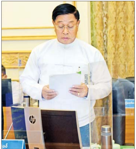
နိုင်ငံတော်စီမံအုပ်ချုပ်ရေးကောင်စီအဖွဲ့ဝင် ဗိုလ်ချုပ်ကြီး တင်အောင်စန်း ရှင်းလင်းတင်ပြစဉ်။