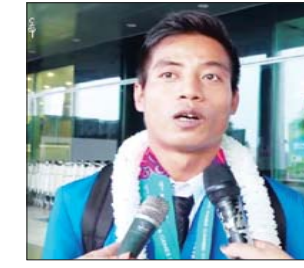
စိုးပေ (ပြေးခုန်ပစ်အားကစား)

ပထမဖိုင်နယ်မှာ ကျွန်တော် တတိယပုံရတယ်။ အတိုင်းမသိဝမ်းသာပါတယ်။ နိုင်ငံတော်အနေနဲ့လည်းကျွန်တော်တို့ကို ဒီလိုမျိုး ချီးမြှင့်မြှောက်စားပြီး လုပ်ပေးထားတဲ့အတွက် ကျွန်တော်တို့အစက ကြိုးစားတာထက်စာရင် အခု ကြိုးစားမှုက ပိုပြီးတော့ကိုယ် ကြိုးစားသလောက် အရာထင်လာတဲ့အတွက် ပိုပြီးတော့လည်း ကြိုးစားမယ်လို့လည်း ပြောချင်ပါတယ်။” ဟု ရေကူးအားကစားသမား အောင်မြင့်မြတ်က ပြောသည်။ “ကျွန်တော်မိတာ ၁၀၀၊ မိတာ ၂၀၀ နဲ့ မိတာ ၄၀၀ လက်ဆင့်ကမ်း