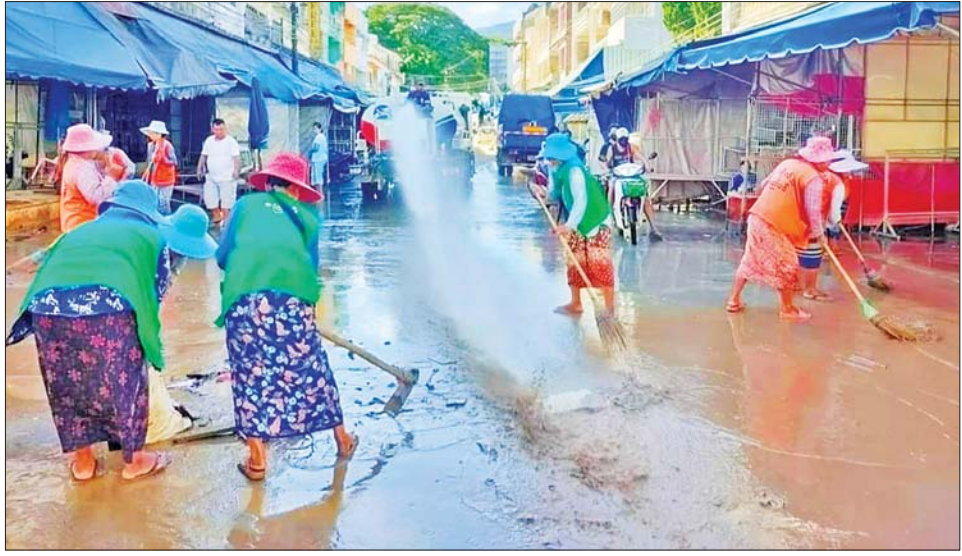
တာချီလိတ်မြို့၌ စည်ပင်သာယာရေးဌာနနှင့် ပြည်သူများ ပူးပေါင်းပြီး တင်ကျန်ခဲ့သော ရွံ့နွံများကို ရှင်းလင်းနေစဉ်။

သာယာရေးဌာနမှ ဦးဆောင်၍ ရပ်ကွက်နေပြည်သူများက ပူးပေါင်းရှင်းလင်း ဆောင်ရွက်လျက်ရှိသည်။ ထိုသို့ဆောင်ရွက်လျက်ရှိရာ၌ ယနေ့နံနက် ၉ နာရီတွင် တာလော့ရပ်ကွက်အတွင်းရှိ လမ်းများနှင့် တာလော့ အခြေခံပညာအလယ်တန်းကျောင်းခွဲ၊ ကျောင်းဝင်းအတွင်း ရေဝင်ရောက်မှုကြောင့် တင်ကျန်ခဲ့သော ရွံ့မြေများကို ဆေးကြောခြင်းနှင့် သန့်ရှင်းရေး ပြုလုပ်ခြင်းများကို မီးသတ်တပ်ဖွဲ့ဝင်များ၊ ရပ်ကွက်အုပ်ချုပ်ရေးမှူးနှင့် ရပ်ကွက်နေပြည်သူများက ပူးပေါင်းရှင်းလင်းဆောင်ရွက်လျက်ရှိကြောင်း သိရသည်။ ယာဆေး (ပြန်/ဆက်)