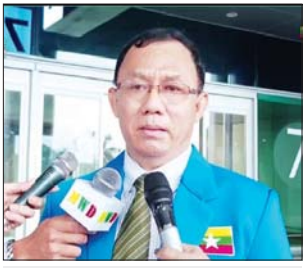
ဦးဝင်းမြင့် ဒုတိယဥက္ကဋ္ဌ

ရန်ကုန် ဩဂုတ် ၁၀ အင်ဒိုနီးရှားသမ္မတနိုင်ငံ ဆိုလိုမြို့၌ ကျင်းပခဲ့သည့် (၁၁) ကြိမ်မြောက် အာဆီယံမသန်စွမ်းသူများ အားကစားပြိုင်ပွဲတွင် ရွှေတံဆိပ်ဆုရ အားကစားသမားများ၏ ပြိုင်ပွဲအတွေ့အကြုံနှင့် ပီတိစကားသံများကို မြန်မာ့အလင်းက တွေ့ဆုံမေးမြန်းခဲ့သည်။ “ရွှေတံဆိပ်ရတဲ့လူက နိုင်ငံအလံကို ထိပ်မှာတင်ပြီး နိုင်ငံတော်သီချင်းကို လွှင့်တဲ့အချိန်မှာ သက်ဆိုင်ရာ ကွင်းထဲမှာရှိတဲ့ ကျွန်တို့နိုင်ငံအားလုံးက မတ်တပ်ရပ်ပြီးတော့ ကိုယ့်နိုင်ငံအလံကို အလေးပြုရတယ်။ အဲဒီခံစားချက်က ဘာနဲ့မှမတူဘူး။ အုပ်ချုပ်သူတွေ၊ နည်းပြတွေက သေချာထားပေးပါတယ်။ ပြီးရင်လစဉ် ကစားသမားတွေရဲ့ တိုးတက်မှုတွေကို ဆန်းစစ်ပါတယ်။ လစဉ်သူတို့ရဲ့ နိုင်ငံတကာမှာပြိုင်တဲ့ စံချိန်တွေနဲ့ ချိန်ထိုးပြီးတော့မှ အားနည်းချက် အားသာချက်တွေ၊ လိုအပ်တာတွေ ဖြည့်စွက်ဆောင်ရွက်ပေးပါ