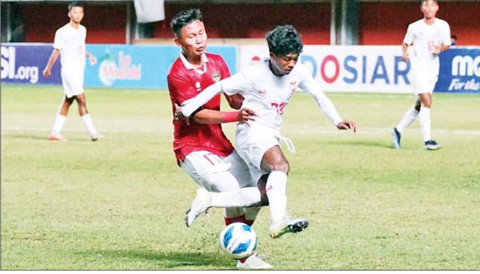
မြန်မာနှင့် အင်ဒိုနီးရှားအသင်း ယှဉ်ပြိုင်နေစဉ်။