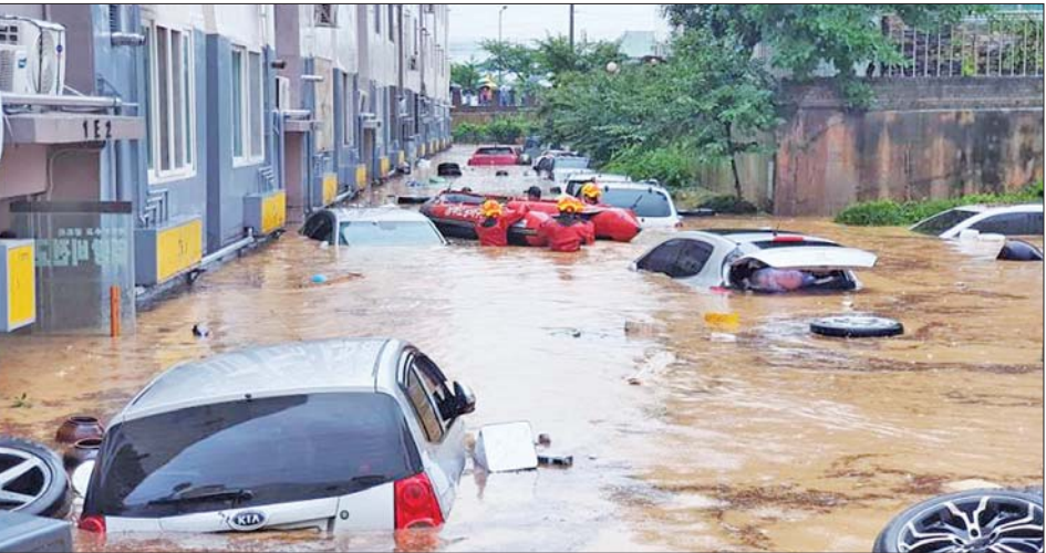
တောင်ကိုရီးယား၌ မိုးသည်းထန်စွာရွာသွန်းပြီးနောက် ရေကြီးရေလျှံမှု ဖြစ်ပွားနေသည်ကို တွေ့ရစဉ်။

အများအားဖြင့် ဆိုးလ်မြို့ရှိ မြေနိမ့်ပိုင်းဒေသများမှ လူနေအိမ်နှင့် အဆောက်အအုံ ၂၆၀၀ ကျော်သည် ရေလွှမ်းမိုးမှုဖြစ်ပေါ်ခဲ့သလို လမ်းပေါ်ရှိ ကားအစီးရေထောင်ပေါင်းများစွာလည်း ရေနစ်မြုပ်မှုဖြစ်ပေါ်ခဲ့သည်။ ဆင်ဟွာ