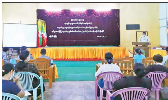
အချိန်ဇယားနှင့်တကွ ရှင်းလင်းဖတ်ကြားသည်။ သင်တန်းသို့ ဌာနဆိုင်ရာ တာဝန်ရှိသူများနှင့် မြောင်းမြ၊ အိမ်မဲ၊ ဝါးခယ်မြို့နယ်တို့မှ ရပ်ရွာအခြေပြု လူကုန်ကူးမှု စိစစ်ဖော်ထုတ်ရေးအဖွဲ့ဝင်များ တက်ရောက်ခဲ့ကြသည်။ မြောင်းမြခရိုင်(ပြန်/ဆက်)