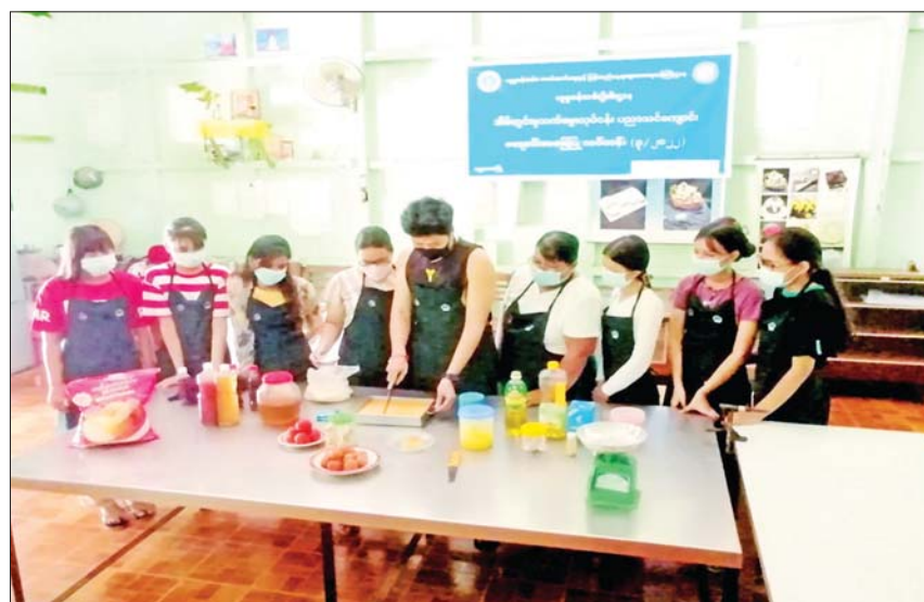
နှစ်အတွက် သင်တန်းအပတ်စဉ်(၃/၂၀၂၂) ဩဂုတ် ၈ ရက်အထိ သင်တန်းသား ကို ဇူလိုင် ၂၅ရက်မှ စက်တင်ဘာ ၂ ရက်အထိ သင်တန်းသူ ၄၅၉ ဦး တက်ရောက်လျက် ဖွင့်လှစ်လျက်ရှိပြီး အိမ်တွင်းမှုသက်မွေး ရှိကြောင်း သိရသည်။ လုပ်ငန်းပညာသင်ကျောင်း ၁၀ ကျောင်းတွင် သတင်းစဉ်

နေပြည်တော် ဩဂုတ် ၁၀ လူမှုဝန်ထမ်း၊ ကယ်ဆယ်ရေးနှင့် ပြန်လည် နေရာချထားရေးဝန်ကြီးဌာန လူမှုဝန်ထမ်း ဦးစီးဌာနက ရန်ကုန်၊ မန္တလေး၊ မော်လမြိုင်၊ ပုသိမ်၊ တောင်ငူ၊ မြစ်ကြီးနား၊ ဖျာပုံ၊ စစ်တွေ၊ ရွာငံနှင့် ထားဝယ်မြို့တို့၌ အိမ်တွင်းမှု သက်မွေးလုပ်ငန်း ပညာသင်ကျောင်းများကို ဖွင့်လှစ်ထားရှိကာ စက်ချုပ်သင်တန်းများ (မိန်းမဝတ်၊ ကလေးဝတ်၊ ကျားရှပ်၊ တိုက်ပုံ၊ ကုတ်အင်္ကျီ)၊ လက်မှုသင်တန်း၊ မုန့်မျိုးစုံပြုလုပ် နည်းသင်တန်း၊ အစားအစာချက်ပြုတ်နည်း သင်တန်းနှင့် ပန်းအလှပြင် သင်တန်းစသည့် သင်တန်းများကို ဘဏ္ဍာရေးနှစ်တစ်နှစ်လျှင် သင်တန်းအပတ်စဉ် ရှစ်ခု၊ အပတ်စဉ်တစ်ခု လျှင် ခြောက်ပတ်ကြာ သင်ကြားပေးလျက်ရှိ သည်။ အဆိုပါ အိမ်တွင်းမှုသက်မွေးလုပ်ငန်း ပညာသင်ကျောင်းများ၌ ၂၀၂၂-၂၀၂၃ ဘဏ္ဍာ