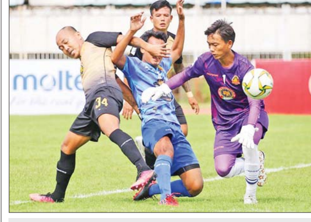
ရခိုင်ယူနိုက်တက်နှင့် ဟံသာဝတီ ယှဉ်ပြိုင်နေစဉ်။

ရှင်ဗွေယန်မြို့၌ မိုးရာသီ ဘောလုံးပွဲကျင်းပ