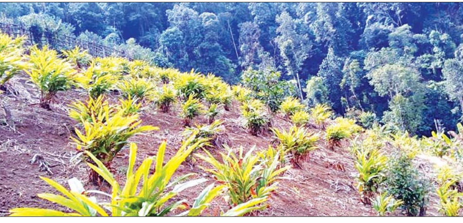
နာဂဒေသ လေရီးမြို့နယ်မှ စိုက်ခင်းများကို တွေ့ရစဉ်။

ပညာပေးဆွေးနွေးခြင်းများ ဆောင်ရွက် နာဂကိုယ်ပိုင်အုပ်ချုပ်ခွင့်ရဒေသရှိ ဒေသခံများအား မွေးမြူရေးလုပ်ငန်းများ တွဲဖက် လုပ်ကိုင်နိုင်ရေးအတွက် မွေးမြူ ရေးနှင့် ကုသရေးဦးစီးဌာနအနေဖြင့် နွားနောက် ၅၀၁၇ ကောင်၊ ကျွဲ ၇၁၂ ကောင်၊ နွား ၉၆၉၂ ကောင်၊ ဆိတ် ၄၉၄၄ ကောင်၊ ဝက် ၅၁၅၉၇ ကောင်၊ ကြက် ကောင်ရေ ၂၅၅၀၇၀ နှင့် ဘဲကောင်ရေ ၃၂၆၄၀ ကို မွေးမြူနိုင်ရေး ဆောင်ရွက် ထားသကဲ့သို့ မွေးမြူထားသည့် တိရစ္ဆာန်များကို ကာကွယ်ဆေးများ ထိုးနှံပေးခြင်း၊ တိရစ္ဆာန်ကူးစက် ရောဂါ ကာကွယ်ထိန်းချုပ်ရေးဆိုင်ရာ ပညာပေးဆွေးနွေးခြင်း၊ တိရစ္ဆာန် အစာပင် စိုက်ပျိုးမှုနှင့် ပတ်သက်၍ ပညာပေးဆွေးနွေးခြင်းများ ဆောင်ရွက် ခဲ့သည်။ နေဗီယာမြက်များ ပိုမိုတိုးချဲ့စိုက်ပျိုးနိုင် ရေးဆောင်ရွက်လျက်ရှိ စစ်ကိုင်းတိုင်း ဒေသကြီးအတွင်း တိရစ္ဆာန်အစာပင် စိုက်ပျိုးထားရှိမှု အနေဖြင့် နေဗီယာမြက် ၂၀၇ ဧက၊