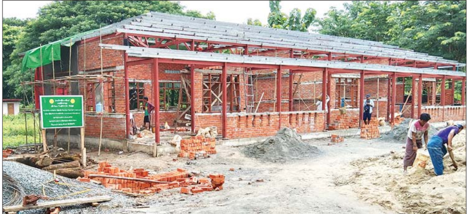
တစ်ထပ်သိပ္ပံကျောင်းဆောင်သစ် တည်ဆောက်နေမှုကို တွေ့ရစဉ်။

ကျောင်းဆောင်သစ် တည်ဆောက်လျက်ရှိရာ ဩဂုတ် ၈ ရက်အထိ ၅၀ ရာခိုင်နှုန်းကျော် ပြီးစီးနေပြီ ဖြစ်သည်။ တစ်ထပ်သိပ္ပံကျောင်းဆောင်