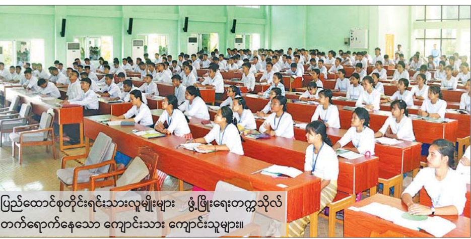
ပြည်ထောင်စုတိုင်းရင်းသားလူမျိုးများ ဖွံ့ဖြိုးရေးတက္ကသိုလ် တက်ရောက်နေသော ကျောင်းသား ကျောင်းသူများ။

ဤသည်မှာလည်း နိုင်ငံတော်အကြီးအကဲများ နှင့် တာဝန်ရှိသူအဆင့်ဆင့်တို့၏ ရည်မှန်းချက် ကြီးမားမှုနှင့် အနာဂတ်နိုင်ငံတော်ကို ဦးဆောင်ကြ မည့် ခေါင်းဆောင်ကောင်းများ၊ ဝန်ထမ်းကောင်းများ ဖြစ်စေရေး စေတနာမှန်သည့် ဆောင်ရွက်ချက်ဟု ဆိုရပေမည်။ အဘယ်ကြောင့်ဆိုသော် နယ်စပ်