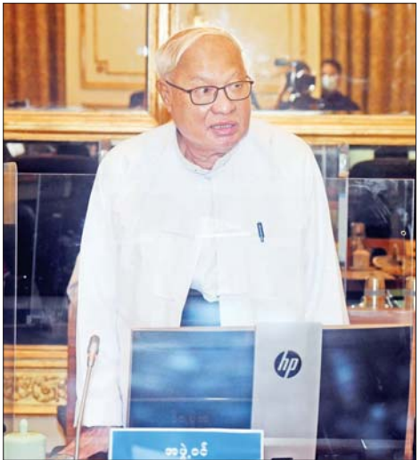
နိုင်ငံတော်စီမံအုပ်ချုပ်ရေးကောင်စီအဖွဲ့ဝင် ဦးသိန်းညွန့် ရှင်းလင်းတင်ပြစဉ်။