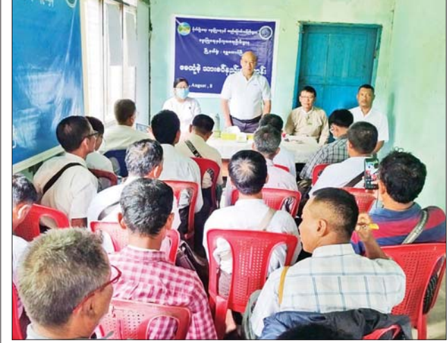
ကိုကိုမင်း( ပြန်/ ဆက်)

ဟိုပုံးမြို့နယ်၌ မိုးသည်းထန်စွာ ရွာသွန်းမှုကြောင့် လမ်းပိတ်ဆို့မှုများဖြစ်ပေါ်