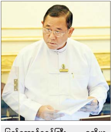
ပြည်ထောင်စုဝန်ကြီး ဒုတိယဗိုလ်ချုပ်ကြီး ထွန်းထွန်းနောင် ရှင်းလင်းတင်ပြစဉ်။