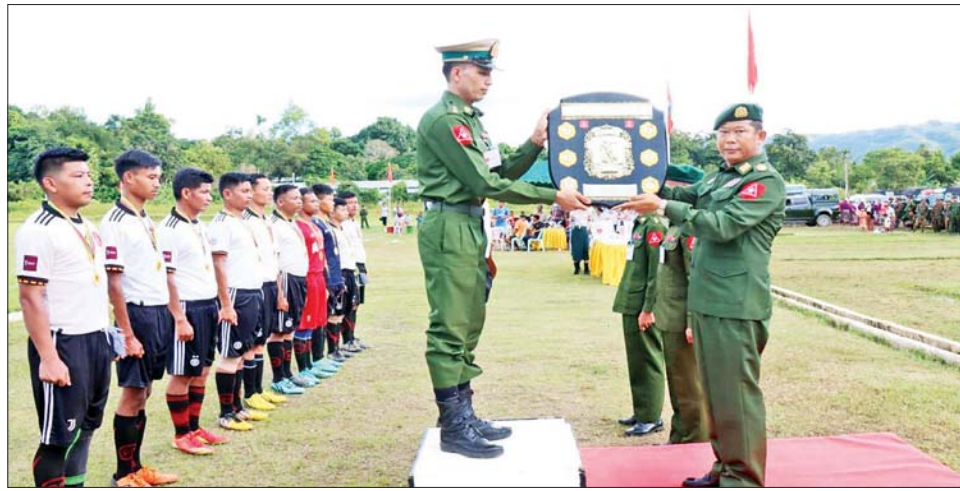
နေပြည်တော် ဩဂုတ် ၉

တြိဂံဒေသတိုင်းစစ်ဌာနချုပ်၏ ၂၀၂၂ ခုနှစ် တိုင်းမှူးခိုင်း ဘောလုံးပြိုင်ပွဲ ဗိုလ်လုပွဲနှင့် ဆုပေးပွဲကို ယနေ့ညနေ ပိုင်းတွင် တိုင်းစစ်ဌာနချုပ် အားကစားကွင်း၌ ကျင်းပရာ တိုင်းမှူး ဗိုလ်ချုပ် မျိုးမင်းထွန်းနှင့် အရာရှိ စစ်သည်၊ မိသားစုများ၊ ခိုင်းအဖွဲ့ဝင်များ၊ ပြိုင်ပွဲဝင်အသင်းများနှင့် အားကစားဝါသနာရှင်များ တက်ရောက်ကြသည်။