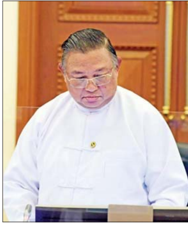
ပြည်ထောင်စုဝန်ကြီး ဦးဝဏ္ဏမောင်လွင် ရှင်းလင်းတင်ပြစဉ်။