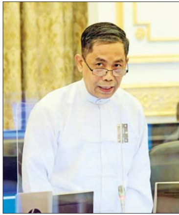
ပြည်ထောင်စုဝန်ကြီး ဦးကိုကိုလှိုင် ရှင်းလင်းတင်ပြစဉ်။