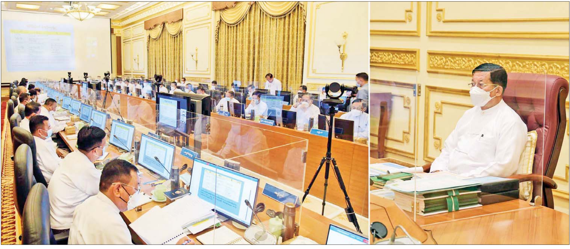
ပြည်ထောင်စုအစိုးရအဖွဲ့ လုပ်ငန်းဆောင်ရွက်ချက်များနှင့်စပ်လျဉ်းသည့် ညှိနှိုင်းအစည်းအဝေး ဒုတိယနေ့ ဆက်လက်ကျင်းပစဉ်။

ပြည်ထောင်စုအစိုးရအဖွဲ့ လုပ်ငန်းဆောင်ရွက်ချက်များနှင့်စပ်လျဉ်းသည့် ညှိနှိုင်းအစည်းအဝေး ဒုတိယနေ့ဆက်လက်ကျင်းပပြုလုပ် နိုင်ငံတော်စီမံအုပ်ချုပ်ရေးကောင်စီဥက္ကဋ္ဌ နိုင်ငံတော်ဝန်ကြီးချုပ် ဗိုလ်ချုပ်မှူးကြီးမင်းအောင်လှိုင် တက်ရောက်၍ လိုအပ်သည်များ လမ်းညွှန်မှာကြား စိုက်ကေများမှ ထွက်ရှိလာသည့် စပါးများနှင့်ပဲတီစိမ်းများကို နိုင်ငံတော်အစိုးရမှဦးစီး၍ ပြည်ပသို့တင်ပို့နိုင်ရေး စီစဉ်ဆောင်ရွက်