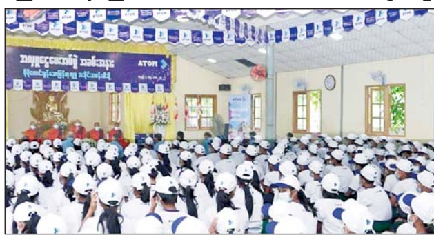
တိုက်ကြီးမြို့နယ်ရှိ YGW ဘုန်းတော်ကြီးကျောင်းသို့ အက်တမ်က အလှူငွေလှူဒါန်းပွဲကို ဩဂုတ် ၅ ရက်က ကျင်းပစဉ်။

အက်တမ်သည် ၂၀၂၃ ခုနှစ်ကုန်အထိ ကော်ပိုရိတ်လူမှုရေးဆိုင်ရာ တာဝန်ယူမှုတာဝန်ဆောင်ရာ ပရောဂျက်များအတွက် ကျပ် သုံးဘီလီယံ လျာထားပြီး ဆက်သွယ်ရေးကဏ္ဍကို အဆင့်မြှင့်တင်ခြင်း၊ အခွင့်အလမ်းများ ဖော်ဆောင်ပေးခြင်းတို့ဖြင့် မြန်မာပြည်သူများအတွက် ပိုမိုကောင်းမွန်သောလူမှုဘဝများဖန်တီးပေးရန် ကတိကဝတ်ပြုထားကြောင်း သိရသည်။