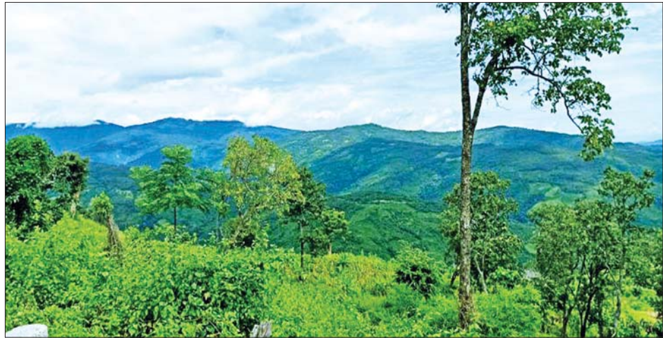
ပေါလယ်-ဝက်ချီပါ ကြိုးပြင်ကာကွယ်တော၏ သဘာဝရှုခင်းပုံ။

ပြည်ထောင်စုသမ္မတ မြန်မာနိုင်ငံတော်အစိုးရ သယံဇာတနှင့် သဘာဝပတ်ဝန်းကျင်ထိန်းသိမ်းရေး ဝန်ကြီးဌာနသည် ၂၀၁၈ ခုနှစ်တွင် ပြဋ္ဌာန်းထားသည့် သစ်တောဥပဒေပုဒ်မ (၆)၊ ပုဒ်မခွဲ (င) အရ အပိတ်နင်း ထားသော အခွင့်အာဏာများကို ကျင့်သုံး၍ မကွေး တိုင်းဒေသကြီး ဂန့်ဂေါခရိုင် ဂန့်ဂေါမြို့နယ်အတွင်း ကျောက်နေသည့် ဧရိယာအကျယ်အဝန်း ၆၈၀၀ ရှိသော နယ်မြေကို “ပေါလယ်-ဝက်ချီပါ ကြိုးပြင်ကာကွယ်တော” အဖြစ် အမိန့်ကြော်ငြာ စာအမှတ် (၁၂၀/၂၀၂၂) အရ ၁၃၈၄ ခုနှစ် ဝါခေါင် လဆန်း ၁၂ ရက် (၂၀၂၂ ခုနှစ် ဩဂုတ် ၈ ရက်) မှစ၍ သတ်မှတ်ကြောင်း ကြေညာလိုက်သည်။ ပေါလယ်-ဝက်ချီပါ ကြိုးပြင်ကာကွယ်တော ဧရိယာသည် ကာကွယ်တောအနီး ပတ်ဝန်းကျင်ရှိ ဒေသခံပြည်သူများ၏ စိုက်ပျိုးမြေများတွင် ရေရရှိ နိုင်သည့် ရေဝေရေလဲဒေသအား ထိန်းသိမ်းရန်၊