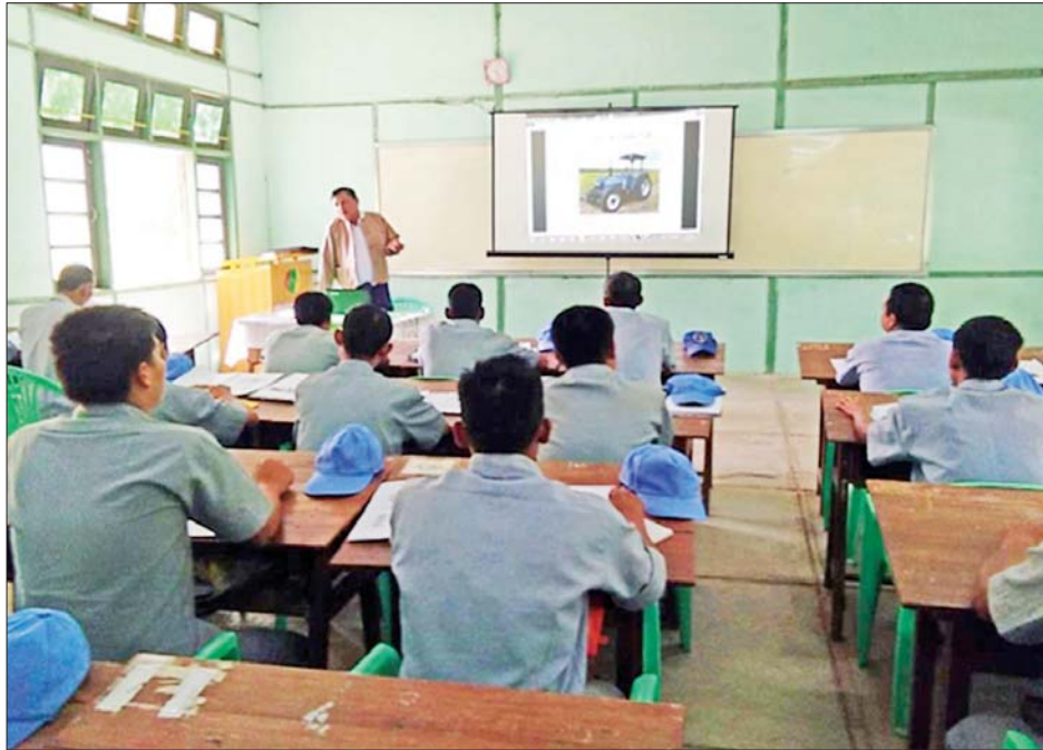
စာတွေ့သင်တန်းချိန် အပြန်အလှန် ဆွေးနွေးခြင်း။

မြန်မာနိုင်ငံ လွတ်လပ်ရေးရချိန်မှ ယနေ့ခေတ် ကာလအထိ ခေတ်အမျိုးမျိုး၊ စနစ်အမျိုးမျိုးတို့ မည်မျှပင် ပြောင်းလဲစေကာမူ စိုက်ပျိုးရေးကို အခြေခံ ကာ နိုင်ငံတော်၏ မောင်းနှင်အားတစ်ရပ်အဖြစ် ခေတ်အဆက်ဆက် ဆောင်ရွက်ခဲ့ကြသည်။ စိုက်ပျိုး ရေးကဏ္ဍသည် နိုင်ငံ၏ အရေးပါသော အခန်းကဏ္ဍ တွင် ပါဝင်သောကြောင့် စက်မှုလယ်ယာကဏ္ဍ