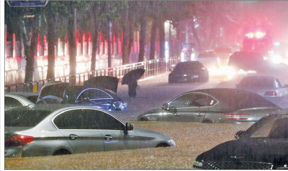
ဆိုးလ်မြို့၌ မိုးသည်းထန်စွာရွာသွန်းမှုကြောင့် ရေကြီးရေလျှံမှုဖြစ်ကာ လမ်းများပေါ်တွင် ကားများ ရေနှစ်မြုပ်နေသည်ကို တွေ့ရစဉ်။

ဆိုးလ်မြို့နှင့် အနောက်ဘက်ရှိ အင်ချွန်းဆိပ်ကမ်းမြို့တို့တွင် တစ် နာရီလျှင် မိုးရေချိန် ၁၀၀ မီလီ မီတာကျော်အထိ ရွာသွန်းခဲ့သည်။ ဒွန်းဂျက် ခရိုင်တွင် တစ်နာရီလျှင် မိုးရေချိန် ၁၄၁ ဒသမ ၅ မီလီမီတာ အထိ ရောက်ရှိခဲ့ပြီး ၁၉၄၂ ခုနှစ် ဩဂုတ်လ နောက်ပိုင်း အမြင့် ဆုံး စံချိန်တင်မိုးရေချိန်အဖြစ် မှတ်တမ်းတင်ခဲ့သည်။ ဆိုးလ် မြို့တော် အနီးတစ်ဝိုက်တွင် ဩဂုတ် ၉ ရက်အထိ မိုးရေချိန် ၃၀၀ မီလီမီတာအထိ ဆက်လက် ရွာသွန်းနိုင်သည်ဟု ခန့်မှန်းထား သည်။ မိုးသည်းထန်စွာ ရွာသွန်းမှု ကြောင့် ဆိုးလ်တွင် လူငါးဦး သေဆုံးကာလေးဦးပျောက်ဆုံးနေ သည့်အပြင် ဂယောင်းဂီပြည်နယ် အတွင်း သုံးဦးသေဆုံးကာ အခြားနှစ်ဦးမှာလည်း ပျောက်ဆုံး လျက်ရှိသည်။ ထို့အတူ ပြည်နယ် အတွင်း လူကိုးဦး ထိခိုက်ဒဏ်ရာ ရရှိခဲ့ပြီး မြို့တော်ဧရိယာရှိ အိမ်ထောင်စု ၂၃၀ မှ လူ ၃၉၁ ဦးသည် အိုးအိမ်များကို စွန့်ခွာ ကာ အများပြည်သူဆိုင်ရာ အဆောက်အအုံများတွင် ခိုလှုံ နေကြရသည်။ ဆင်ယွာ