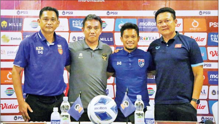
ဆီမီးဖိုင်နယ်တက်ရောက်လာသည့် မြန်မာ၊ ထိုင်း၊ ဗီယက်နမ်နှင့် အင်ဒိုနီးရှား အသင်း နည်းပြချုပ်များ။