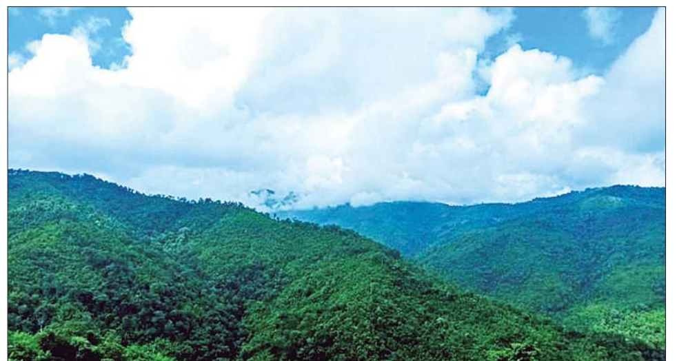
ပေါလယ်-ဝက်ချီပါ ကြိုးပြင်ကာကွယ်တော၏ သဘာဝရှုခင်းပုံ။

ဒေသခံပြည်သူများ၏ လိုအပ်ချက်များကို ဖြည့်ဆည်း ပေးရန်နှင့် သဘာဝတောရိုင်းတိရစ္ဆာန်များ ကာကွယ် စောင့်ရှောက်ရန် ရည်ရွယ်၍ ကြိုးပြင်ကာကွယ်တော အဖြစ် သတ်မှတ်ခြင်းဖြစ်ပါသည်။