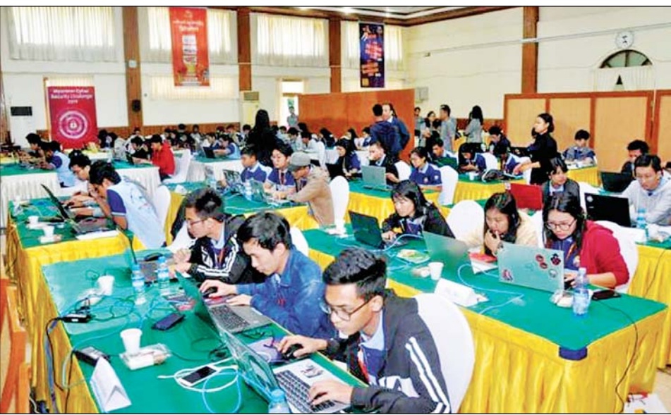
၂၀၁၉ ခုနှစ်က ကျင်းပခဲ့သောပြိုင်ပွဲတွင် ဝင်ရောက်ယှဉ်ပြိုင်နေသော ပြိုင်ပွဲဝင်အသင်းများ။

ပြိုင်ပွဲတွင် အသင်းပေါင်း ၂၀ သာ ဝင်ရောက်ယှဉ်ပြိုင်ခွင့်ရမည်ဖြစ်ပြီး အချက်အလက် ပြည့်စုံစွာ