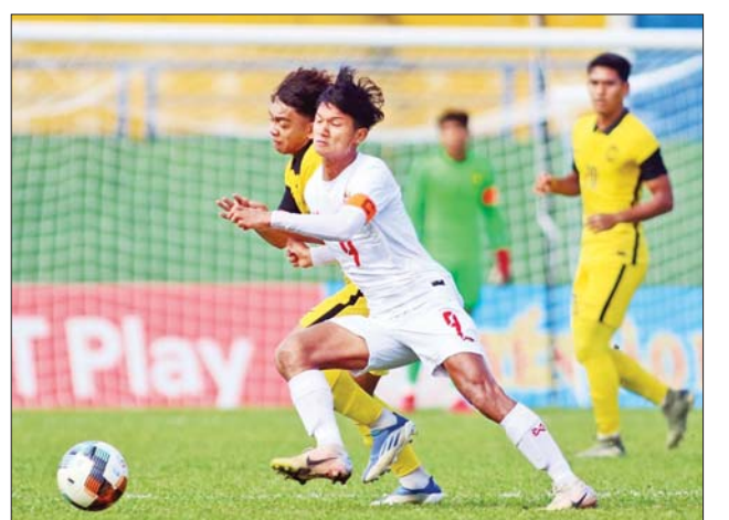
မြန်မာနှင့် မလေးရှား ယှဉ်ပြိုင်နေစဉ်။

မြန်မာအသင်းသည် အုပ်စု သုံးပွဲစလုံးအရေးနိမ့်ခဲ့သဖြင့် အုပ်စု အောက်ဆုံးနေရာ၌ ရပ်တည်ခဲ့ပြီး တတိယနေရာလုပွဲသာ ကစား ရတော့မည်ဖြစ်သည်။ ရဲရင့်လွင်၊မာတ်ပုံ-VFF