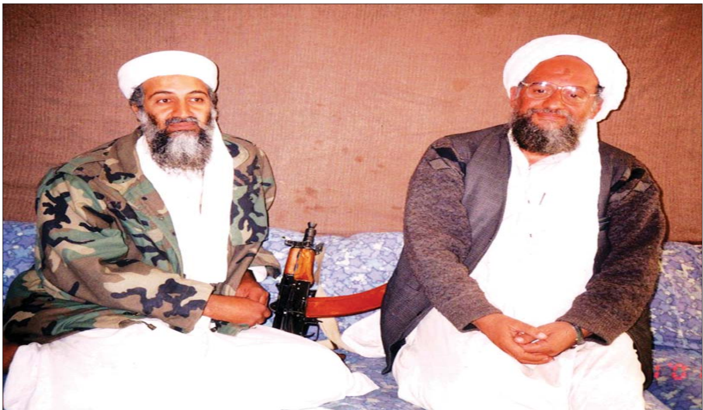
အိုစမာဘင်လာဒင် (ဘယ်) နှင့် အီမန်အယ်လ်ဇာဝါဟီရီတို့ကို အတူတကွ တွေ့ရစဉ်။

အမေရိကန်ဦးတည်တိုက်ခိုက် လွန်ခဲ့တဲ့သီတင်းပတ်အတော်ကြာက ကဘူးလ် မြို့လယ်ရဲ့ နံနက်ခင်းတိုက်ခိုက်မှုတစ်ခုမှာ ၂၁ နှစ် ကြာ လိုက်လံဖမ်းဆီးနေတဲ့ အီဂျစ်အစွန်းရောက် တစ်ဦးကို သုတ်သင်ခဲ့ပါတယ်။ သူဟာ ဘင်လာဒင် ဘေးမှာ သူများတွေထက် အချိန်အတော်ကြာ ရှိနေ ခဲ့ပြီး အမေရိကန်ပြည်ထောင်စုကို တိုက်ခိုက်မှုတွေ မှာ တာဝန်အရှိဆုံးပုဂ္ဂိုလ်တစ်ဦး ဖြစ်ခဲ့ပါတယ်။ ထို့အတူ အမေရိကန်တွေကို ဦးတည်တိုက်ခိုက်ဖို့ ဘယ်တော့မှ လက်လျှော့မယ့်သူ တစ်ဦးလည်း မဟုတ်ပါဘူး။