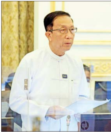
ပြည်ထောင်စုဝန်ကြီး ဦးဝင်းရှိန် ရှင်းလင်းတင်ပြစဉ်။