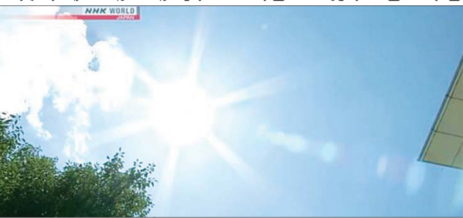
အပူလျှပ်မှုကြောင့် နိုင်ငံတစ်ဝန်း အပူချိန် မြင့်တက်လာခြင်းကို ဖော်ပြရန် ဖြစ်သည်။

ပထမနှစ်ဝက်အတွင်း လာအိုသို့ ခရီးသွားဝင်ရောက်မှု မြင့်တက်လာ ဖိယင်ကျင်း ဩဂုတ် ၉ လာအိုနိုင်ငံ၌ ကိုဗစ်-၁၉ ရောဂါကူးစက်မှုကျဆင်းလာခြင်းနှင့်အတူ ခရီးသွားလာရေးဆိုင်ရာ ကန့်သတ်ချက်များ ဖြေလျှော့ပေးမှုကြောင့် ယခုနှစ် ပထမခြောက်လအတွင်း နိုင်ငံတွင်းသို့ လာရောက်လည်ပတ်သူ အရေအတွက် မြင့်တက်လာခဲ့ကြောင်း ဆင်ယွာသတင်းတစ်ရပ်၏ ဖော်ပြချက်အရ သိရသည်။ ယခုနှစ် ပထမခြောက်လအတွင်း လာအိုနိုင်ငံတွင်းသို့ ခရီးသွားဖိစာ ဖြင့် လာရောက်လည်ပတ်သည့် နိုင်ငံခြားသား ဦးရေသည် ၄၂၁၉၇ ဦး ရှိကြောင်း သိရသည်။ လာအိုအစိုးရက နိုင်ငံတွင်းသို့ ခရီးသွားများ ဝင်ရောက်ခွင့်ပြုလိုက်ပြီးနောက် မေလနှင့် ဇွန်လသည် နိုင်ငံခြားခရီး သွားဧည့်သည်ဝင်ရောက်မှု အများဆုံးဖြစ်ပြီး ၃၅၉၈၃ ဦးအထိရှိကြောင်း လာအိုနေ့စဉ် သတင်းစာ ဖိယင်ကျင်းတိုင်းမိက ဩဂုတ် ၉ ရက်တွင် ဖော်ပြထားသည်။ ခရီးသွားအများစုသည် လာအိုနိုင်ငံတွင်းသို့ မြို့တော်ဖိယင်ကျင်း ရှိ လာအို-ထိုင်းချစ်ကြည်ရေးတံတား၊ ဝပ်တေအပြည်ပြည်ဆိုင်ရာ လေဆိပ်နှင့် လူအန်ပရာဘန်း အပြည်ပြည်ဆိုင်ရာလေဆိပ်တို့မှ ဝင်ရောက်လာကြခြင်း ဖြစ်သည်။ ယခုနှစ် ပထမခြောက်လအတွင်း ပြည်တွင်းခရီးသွားဧည့်သည် ၆၂၆၈၂၅ ဦးရှိသည့်အတွက် ယခင်နှစ် အလားတူကာလနှင့်နှိုင်းယှဉ်ကြည့်မည်ဆိုပါက ၂ ဒသမ ၈ ရာခိုင်နှုန်း မြင့်တက်လာကြောင်း သိရသည်။ ဆင်ယွာ