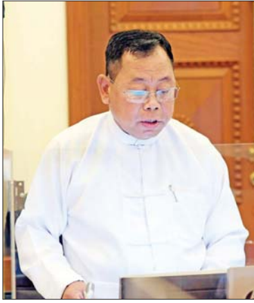
ပြည်ထောင်စုဝန်ကြီး ဒုတိယဗိုလ်ချုပ်ကြီး စိုးထွဋ် ရှင်းလင်းတင်ပြစဉ်။