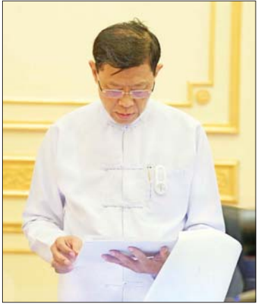
ပြည်ထောင်စုဝန်ကြီး ဗိုလ်ချုပ်ကြီး မြထွန်းဦး ရှင်းလင်းတင်ပြစဉ်။