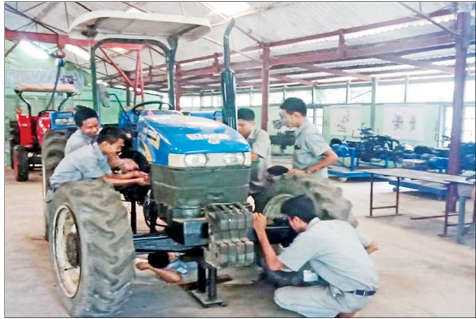
စာတွေ့နှင့် သရုပ်ပြ ပို့ချခြင်း။

ထိုကဲ့သို့ စက်မှုလယ်ယာကျွမ်းကျင်လုပ်သား များ လိုအပ်ခြင်းအားနည်းချက်ကို နိုင်ငံတော်၏ အားသာချက်အဖြစ် ပြောင်းလဲရန်နှင့် စက်မှုလယ်ယာ