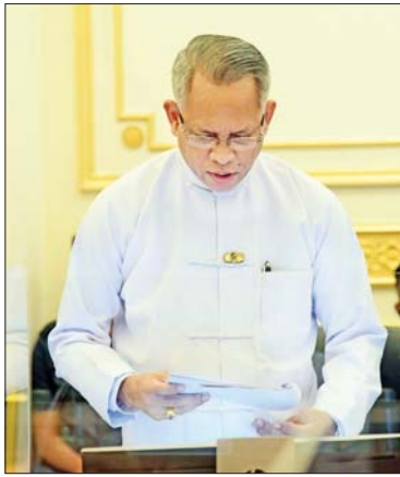
ပြည်ထောင်စုဝန်ကြီး ဦးအောင်နိုင်ဦး ရှင်းလင်းတင်ပြစဉ်။