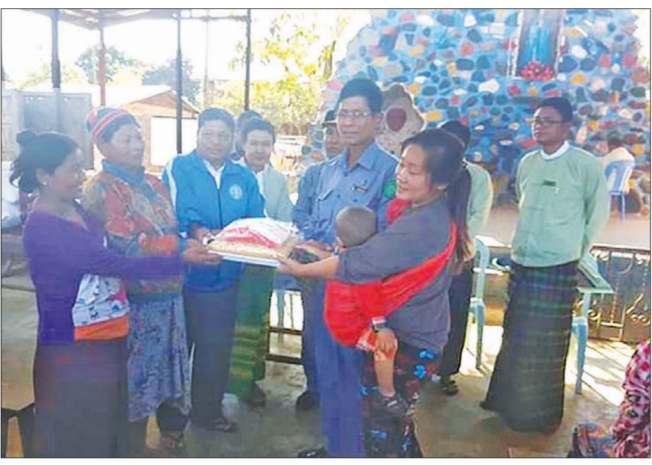
ကချင်ပြည်နယ်အတွင်းရှိ ယာယီတိုက်ပွဲရှောင်စခန်းများ၌ တိုက်ပွဲရှောင်မိသားစုများအတွက် သက်ဆိုင်ရာ တာဝန်ရှိသူများက ထောက်ပံ့ပစ္စည်းများ ထောက်ပံ့ပေးအပ်စဉ်။

ကချင်ပြည်နယ်အတွင်း၌ SMART Village ကျေးရွာများအဖြစ် မြစ်ကြီးနားမြို့နယ်တွင် မော်ဖောင်း နယ်မြေ-၈ ကျေးရွာ၊ ဗန်းမော်မြို့နယ် တွင် မန်ကျေးကျေးရွာ၊ မိုးကောင်းမြို့နယ်တွင် နန်းလှိုင်ကျေးရွာတို့ကို သတ်မှတ်ရွေးချယ် အကောင်အထည်ဖော် ဆောင်ရွက်ပေးနေပြီ ဖြစ်သည်။ အခြားသော ပြည်နယ်၊ တိုင်းဒေသကြီး တော်တော်များများထဲက SMART Village စံပြ ကျေးရွာအချို့ကို ကျွန်တော်သွားခဲ့ ရောက်ခဲ့ပြီး