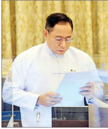
ပြည်ထောင်စုဝန်ကြီး ဒုတိယဗိုလ်ချုပ်ကြီး ရာပြည့် ရှင်းလင်းတင်ပြစဉ်။