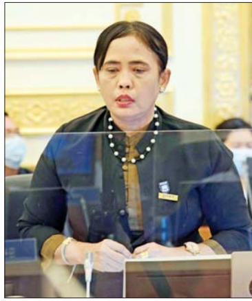
ပြည်ထောင်စုဝန်ကြီး ဒေါက်တာ သီတာဦး ရှင်းလင်းတင်ပြစဉ်။