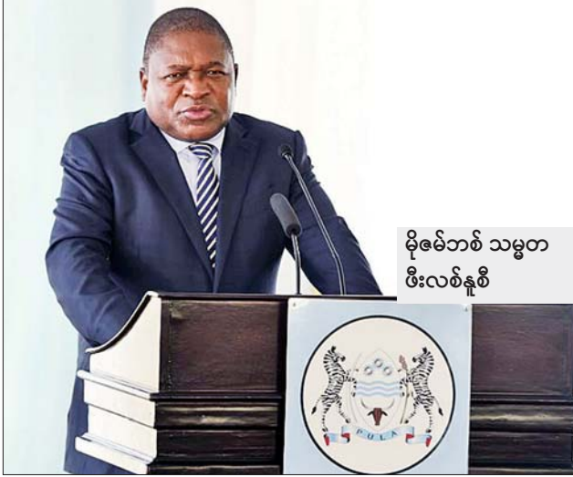
မိုဇမ်ဘစ် သမ္မတ ဖီးလစ်နူစီ

မပူတို ဩဂုတ် ၉ နိုင်ငံတွင်းရှိ လူငယ်များသည် အကြမ်းဖက် အုပ်စုများနှင့် ဆက်သွယ်ရန် ကမ်းလှမ်းချက်များကို လက်မခံဘဲ ငြင်းဆိုရန်နှင့် လူနေမှုစရိတ်စကများ ကြီးမြင့်လာခြင်းနှင့် အလုပ်အကိုင်များ ရှာဖွေရာတွင် ရင်ဆိုင်ကြုံတွေ့နိုင်သည့် ဒုက္ခအခက်အခဲများကို ကျော်လွှားရာတွင် တရားမဝင် နည်းလမ်းများ အသုံးမပြုဘဲ ရှောင်ရှားကြရန် မိုဇမ်ဘစ်သမ္မတ ဖီးလစ်နူစီက ဩဂုတ် ၈ ရက်က တိုက်တွန်း ပြောကြားလိုက်