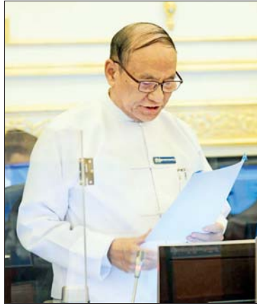
ပြည်ထောင်စုဝန်ကြီး ဦးချစ်နိုင် ရှင်းလင်းတင်ပြစဉ်။