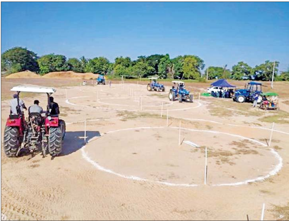
ပုံစံမောင်း သင်ကြားလေ့ကျင့်ခြင်း။