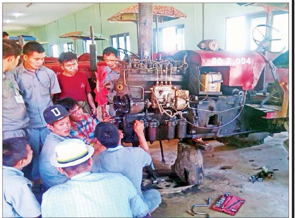
ပြင်ဆင်ခြင်း လက်တွေ့ပို့ချခြင်း။