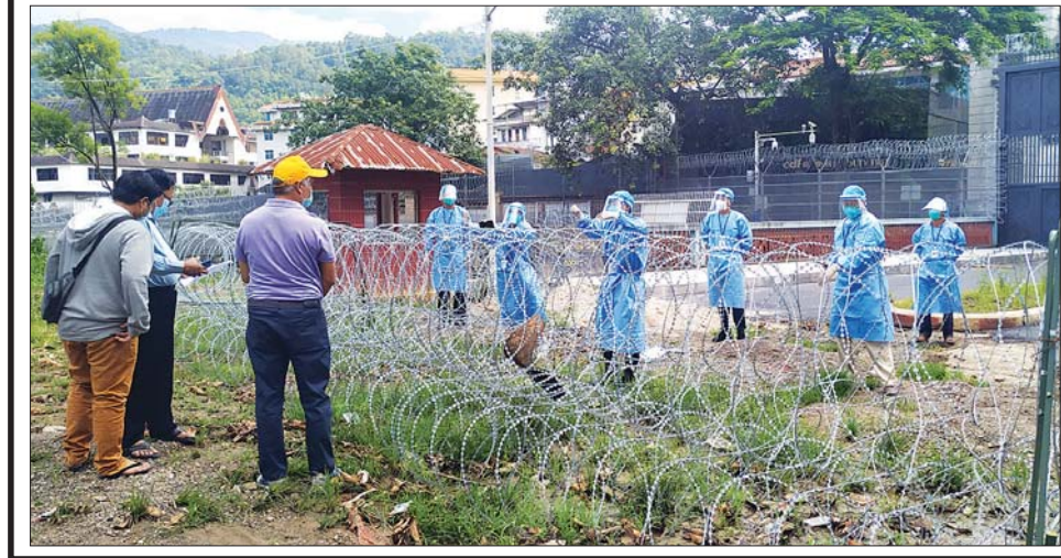
ပန်ဆိုင်(ပြန်/ဆက်)

အဆိုပါ တံတားပြုပြင်ခြင်း ကို တစ်ဖက်နိုင်ငံမှ လုပ်ငန်း ဆောင်ရွက်ရာတွင် လုပ်ငန်းခွင် ဘေးအန္တရာယ်ကင်းရှင်းရေးနှင့် မသက်ဆိုင်သူများ ဝင်ရောက်မှု မရှိစေရေးအတွက် မြန်မာ ဘက်ခြမ်း တံတားထိပ်ပြင်ပ ယခင်ကာရံထားသည့် သုံးမီတာ မှ ယခုထပ်မံ၍ ကိုးမီတာခန့် နောက်ဆုတ်ကာ ဘာလိတ်စား သံဆူးကြိုးဖြင့် ယာယီ ခြံစည်းရိုး ထားရှိခြင်း၊ တရုတ်နိုင်ငံဘက် တံတား ချဉ်းကပ်ခုံတစ်လျှောက် နှင့် မြန်မာနိုင်ငံဘက်ခြမ်း တံတားချဉ်းကပ်ခုံတစ်လျှောက် မီတာ ၅၀ စီအတွင်း ကျောက်စီ မြေထိန်းနံရံ ပြုလုပ်ခြင်းတို့နှင့် ပတ်သက်၍ လိုအပ်သည်များ ညှိနှိုင်း ဆွေးနွေးကြကြောင်း သိရသည်။