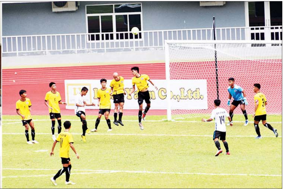
နိုင်ငံတော်စီမံအုပ်ချုပ်ရေးကောင်စီအဖွဲ့ဝင်များနှင့် တာဝန်ရှိသူများ ၂၀၂၂ ခုနှစ် ပြည်နယ်နှင့် တိုင်းဒေသကြီး အသက် (၁၉) နှစ်အောက် အမျိုးသားဘောလုံးပြိုင်ပွဲ ဗိုလ်လုပွဲ ယှဉ်ပြိုင်ကစားနေမှုကို ကြည့်ရှု အားပေးစဉ်။