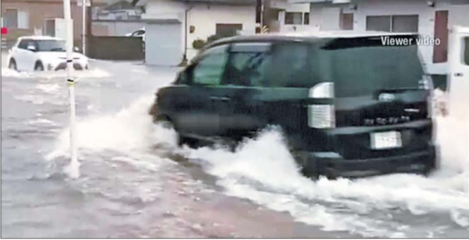
ဂျပန်နိုင်ငံ ယာမာဂါတာခရိုင်တွင် ရေကြီးရေလျှံဖြစ်ပွားနေသည်ကို တွေ့ရစဉ်။