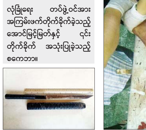
လုံခြုံရေး တပ်ဖွဲ့ဝင်အား အကြမ်းဖက်တိုက်ခိုက်ခဲ့သည့် အောင်မြင့်မြတ်နှင့် ၎င်း တိုက်ခိုက် အသုံးပြုခဲ့သည့် စကောဘာ။