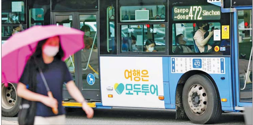
တောင်ကိုရီးယားနိုင်ငံ ဆိုးလ်မြို့၌ အမျိုးသမီးတစ်ဦး ပါးစပ်နှာခေါင်းစည်း တပ်ဆင်သွားလာနေသည်ကို တွေ့ရစဉ်။

ဆိုးလ်၊ ဩဂုတ် ၃ ရက်ပေါင်း ၁၁၀ အတွင်း တောင်ကိုရီးယားနိုင်ငံ၏ ကိုဗစ်-၁၉ ကူးစက်ဖြစ်ပွားမှုသည် အမြင့်ဆုံးပမာဏအထိ စံချိန်တင်ခဲ့သည်။ ယခုအခါ နိုင်ငံအတွင်း ကိုဗစ်-၁၉ ကူးစက်ဖြစ်ပွားသူပေါင်း သန်း ၂၀ ကျော် ရောက်ရှိလာပြီဖြစ်ကြောင်း ဩဂုတ် ၃ ရက်က ထုတ်ပြန်သော တရားဝင် သတင်းအချက်အလက်များအရ သိရသည်။ ဩဂုတ် ၂ ရက် သန်းခေါင်ယံ အချိန်အထိ လွန်ခဲ့သော ၂၄ နာရီအတွင်း ကိုဗစ်-၁၉ ထပ်မံကူးစက် ဖြစ်ပွားသူ ၁၉၉၂၂ ဦးအထိ ရှိလာခဲ့ကြောင်း ကိုရီးယားရောဂါထိန်းချုပ်ရေးနှင့် ကာကွယ်ရေးအေဂျင်စီ(ကေဒီစီအေ)က ပြောသည်။ ဧပြီလလယ်မှစကာ ရက်ပေါင်း ၁၁၀ အတွင်း တစ်နေ့တည်း ကိုဗစ်-၁၉ ကူးစက်ဖြစ်ပွားမှု