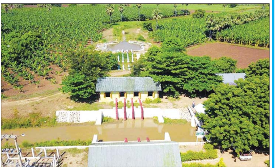
စစ်ကိုင်းတိုင်းဒေသကြီးမှ ဘုတလင် Low Lift မြစ်ရေတင်စီမံကိန်း။

(အလျား ၂၅၀ မိုင်) ကို ဆည်မြောင်းနှင့် ရေအသုံး ချမှုစီမံခန့်ခွဲရေးဦးစီးဌာနအနေဖြင့် ထိန်းသိမ်း ထားရှိပြီး ရေဘေးကာကွယ်ရေး ဧရိယာဧက ၂၇ ဒသမ ၂၇ သိန်းကို နှစ်စဉ်ရေကြီးနစ်မြုပ်မှုအန္တရာယ်မှ ကာကွယ်ပေးနိုင်ခဲ့သည်။ မြန်မာနိုင်ငံတွင် နှစ်စဉ်ကြုံတွေ့နေရသော ရေကြီးနစ်မြုပ်မှုအန္တရာယ်မှ ကြိုတင်ကာကွယ်ရန် နှင့် ရေကြီးနစ်မြုပ်မှု သက်သာစေရေးအတွက် ဝန်ကြီးဌာန၏ ပြည်ထောင်စုရန်ပုံငွေ၊ တိုင်းဒေသ ကြီး/ပြည်နယ်ရန်ပုံငွေဖြင့် ချောင်းကော၊ မြောင်း ကော၊ သဘာဝရေနုတ်မြောင်းများ ပြန်လည် တူးဖော်ခြင်းလုပ်ငန်းများ၊ မြစ်ကမ်းပါး၊ ချောင်း ကမ်းပါးရှိ တာတံများ အသစ်တည်ဆောက်ခြင်း၊ တာတံ တောင့်တင်းခိုင်မာအောင်ပြုပြင်ခြင်းနှင့် ပင်လယ်ဒီရေမဝင်ရောက်နိုင်ရန် ရေငန်တား တာ များ ပြင်ဆင်ထိန်းသိမ်းခြင်း လုပ်ငန်းများကို ဆည်မြောင်းနှင့် ရေအသုံးချမှုစီမံခန့်ခွဲရေး ဦးစီးဌာန အနေဖြင့် နှစ်စဉ်အကောင်အထည်ဖော်လျက်ရှိသည်။ ထိုသို့ အကောင်အထည်ဖော် ဆောင်ရွက်မှု