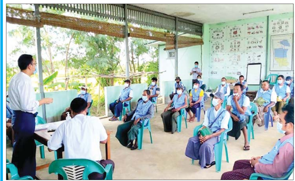
ရေအသုံးချသူများအဖွဲ့ ဖွဲ့စည်းရန် ပြည်သူများအား ဆွေးနွေးနေစဉ်။

စာမျက်နှာ ၂၀ မှ မကွေးတိုင်းဒေသကြီးတွင် အောင်နန်းမြေအောက် တံ၊ ကျတိုပြည့်မြေအောက်တံ၊ ဖောင်ကျောင်း မြေအောက်တံ၊ ရိုးရမြေအောက်တံ၊ ဥသျှစ်ကုန်း မြေအောက်တံနှင့်ရေထွက်မြေအောက်တံများကို တည်ဆောက်အကောင်အထည်ဖော်ပြီး ပြည်သူ့ အကျိုးပြု ဖြည့်ဆည်းဆောင်ရွက်နိုင်ခဲ့သည်။