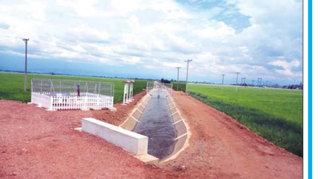
ချောင်းမငယ်ရှေ့ပြေးစီမံကိန်းဧရိယာအတွင်း မိုးရေချိန်စခန်း ထားရှိ၍ သုတေသနဆောင်ရွက်နေပုံ။