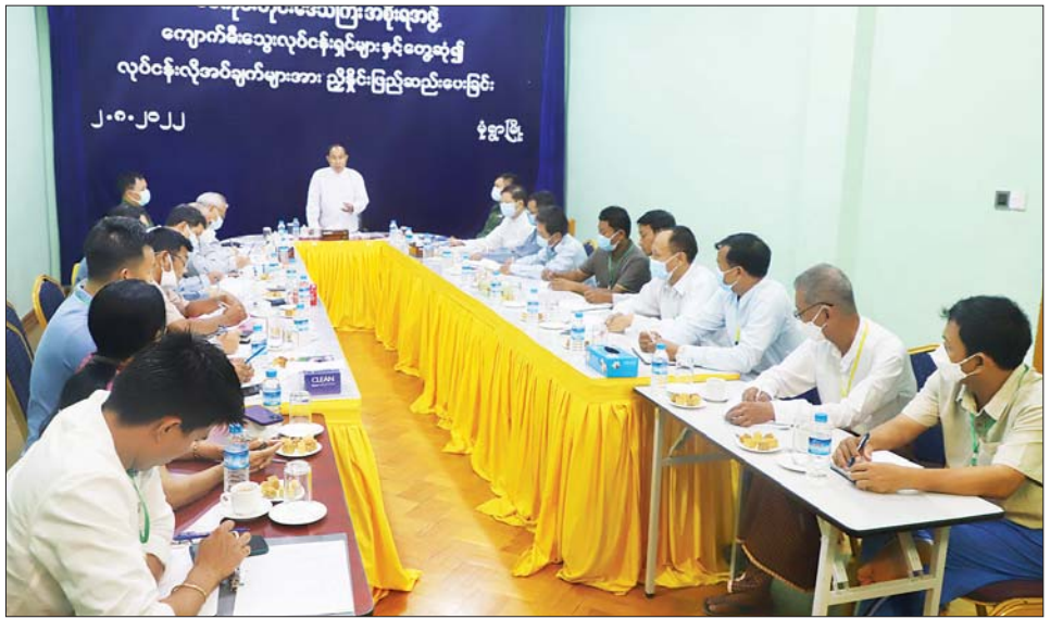
ပတ်သက်၍ ဆွေးနွေးတင်ပြကြပြီး တက်ရောက်လာ သူများက လုပ်ငန်းများနှင့် ပတ်သက်၍ အထွေထွေ ဆွေးနွေးတင်ပြကြသည်။ ထို့နောက် တိုင်းဒေသကြီး ဝန်ကြီးချုပ်က ဆွေးနွေးပွဲသို့ တက်ရောက်လာသူများ၏ ဆွေးနွေး တင်ပြချက်များအပေါ် တာဝန်ရှိသူများနှင့်ဖြည့်ဆည်း ပေါင်းစပ် ဆောင်ရွက်ပေးကြောင်း သိရသည်။ တိုင်းဒေသကြီး(ပြန်/ဆက်)