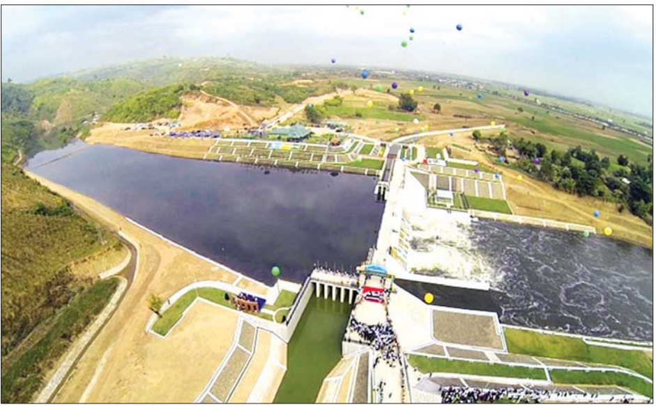
ဖြူးချောင်းရေလွှဲဆည်

ကမ္ဘာနှင့်အဝန်းဖြစ်ပေါ်နေသည့် ရာသီဥတု ပြောင်းလဲမှုဖြစ်စဉ်များအရ အချိန်တိုအတွင်း မိုးရွာ သွန်းမှုများပြားခြင်းကြောင့် ရေကြီးနစ်မြုပ်မှု သဘာဝဘေးအန္တရာယ်များ ပျက်စီးဆုံးရှုံးမှုများ ကြုံတွေ့လာရသည်။ သို့အတွက် တည်ဆောက် ထိန်းသိမ်းထားသော ရေလှောင်တမံများ၏ ဘေးကင်းလုံခြုံမှုနှင့် ပတ်သက်၍ နေ့စဉ်ပုံမှန် စစ်ဆေးခြင်း ဆောင်ရွက်ကာ မှတ်တမ်းရေးသား ခြင်းကို ဆည်မြောင်းနှင့် ရေအသုံးချမှုစီမံခန့်ခွဲရေး ဦးစီးဌာနအနေဖြင့် ဆောင်ရွက်လျက်ရှိသည်။