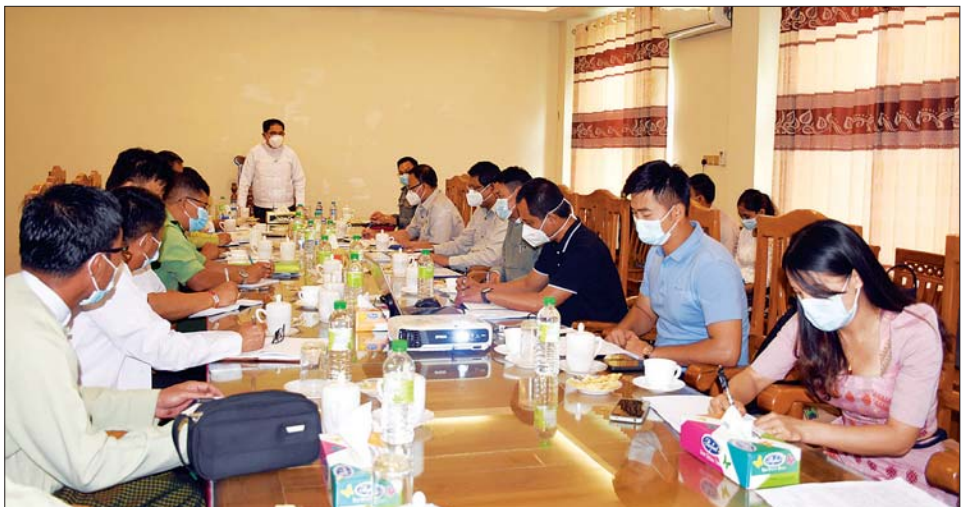
အစည်းအဝေးတွင် ပြည်နယ်ဝန်ကြီးချုပ် ဦးခက်ထိန်နန် အမှာစကား ပြောကြားစဉ်။

တင်ပြမှုများအပေါ် ပြည်နယ်ဝန်ကြီးများ၊ ပြည်နယ်လမ်းဦးစီးဌာနမှူးနှင့် ဌာနဆိုင်ရာ တာဝန် ရှိသူများက ဖြည့်စွက်တင်ပြပြီး ပြည်နယ်ဝန်ကြီး ချုပ်က လမ်းလုပ်ငန်းစီမံကိန်းများ အကောင်အထည် ဖော်ဆောင်ရွက်ရာတွင် လုပ်ငန်းစာချုပ်ပါအတိုင်း ပြီးစီးအောင် ဆောင်ရွက်နိုင်ရေး လိုအပ်ချက်၊ အခက် အခဲများကို တည်ဆဲဥပဒေ လုပ်ထုံးလုပ်နည်းများနှင့်