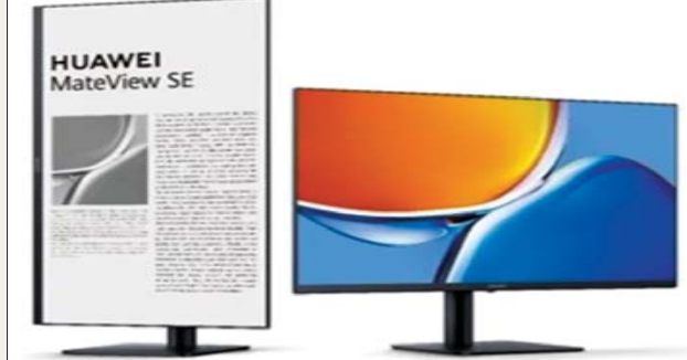
ကိုစိုး၊ ကိုးကား- consumer.huawei.com

MateView SE မော်နီတာသည် မျက်နှာပြင်အကျယ် ၂၃ ဒသမ ၈ လက်မရှိပြီး မျက်နှာပြင်သည် ကိုယ်ထည်၏ ၉၂ ရာခိုင်နှုန်းအထိရှိသည်။ ကွန်ပျူတာကို အသုံးပြုမှုအပေါ်မူတည်ပြီး မော်နီတာကို ဒေါင်လိုက်အနေအထားပြောင်း၍ အသုံးပြုနိုင်သလို eBook Mode ကို ဖွင့်ထားပါက မျက်စိအာရုံစိုက်မှုကိုသက်သာစေသော Ink-on-paper effect ကို ပြပေးမည်ဖြစ်သည်။ မော်နီတာမျက်နှာပြင်၏ Display ပိုင်းအရည်အသွေးနှင့်ပတ်သက်၍ နိုင်ငံတကာအသိအမှတ်ပြုလက်မှတ်များကိုလည်း ရရှိထားပြီးဖြစ်ကြောင်း သိရသည်။