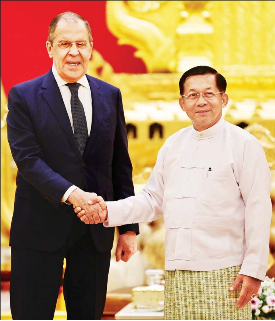
နိုင်ငံတော်စီမံအုပ်ချုပ်ရေးကောင်စီဥက္ကဋ္ဌ နိုင်ငံတော်ဝန်ကြီးချုပ် ဗိုလ်ချုပ်မှူးကြီး မင်းအောင်လှိုင် ရုရှားဖက်ဒရေးရှင်းနိုင်ငံ နိုင်ငံခြားရေးဝန်ကြီး H.E. Sergey Lavrov အား ရင်းရင်းနှီးနှီး နှုတ်ဆက်စဉ်။

ထိုသို့တွေ့ဆုံဆွေးနွေးရာတွင် နှစ်နိုင်ငံဆက်ဆံရေးသည် ၂၀၂၃ ခုနှစ်တွင် ၇၅ နှစ် ပြည့်မြောက် တော့မည်ဖြစ်၍ စိန်ရတုအခမ်း အနားများ ကျင်းပပြုလုပ်နိုင်ရေး၊ ရုရှား-မြန်မာ နှစ်နိုင်ငံသည် မိတ်ဆွေရင်း ညီအစ်ကိုနိုင်ငံများ ဖြစ်သည့်အတွက် သံတမန် ဆက်ဆံမှုများ တိုးမြှင့်ဆောင်ရွက် နိုင်ရေးအတွက် ရုရှားနိုင်ငံ၌ မြန်မာကောင်စစ်ဝန်ရုံး နှစ်ခု ထပ်မံဖွင့်လှစ်သွားမည့် အခြေ အနေနှင့် မြန်မာနိုင်ငံတွင်လည်း ရုရှားကောင်စစ်ဝန်ရုံးများ ဖွင့်လှစ် နိုင်ရေး ကြိုးပမ်းဆောင်ရွက်သွား မည့် အခြေအနေ၊ အမြဲတမ်း မိတ်ဆွေနိုင်ငံ အမြဲတမ်းမဟာ မိတ်နိုင်ငံများအဖြစ် ပူးပေါင်း ဆောင်ရွက်သွားမည့် အခြေအနေ၊ ရုရှားနိုင်ငံနှင့် မြန်မာနိုင်ငံတို့သည် အချုပ်အခြာ အာဏာပိုင်နိုင်ငံများ ဖြစ်သည့်အတွက် မိမိတို့နိုင်ငံ၏ ပြည်တွင်းရေးကို ပြည်ပစွက်ဖက် မှုများမပါဘဲ မိမိတို့အစိုးရများက စီမံဆောင်ရွက်နိုင်သည့် အခြေ အနေ၊ ရုရှား-မြန်မာ ချစ်ကြည် ရေး အသင်းများ တိုးချဲ့ဖွင့်လှစ် ဆောင်ရွက်သွားမည့် အခြေအနေ၊ နှစ်နိုင်ငံအစိုးရနှင့် တပ်မတော် အရာရှိကြီးများ ချစ်ကြည်ရေးခရီး အပြန်အလှန် လည်ပတ်ရေး၊ ကာကွယ်ရေးဆိုင်ရာ ပူးပေါင်း ဆောင်ရွက်မှုများ ပိုမိုမြှင့်တင်ရေး၊ ကုန်သွယ်မှုနှင့် စီးပွားရေး ပူးပေါင်းဆောင်ရွက်မှုများ၊ ခရီး သွားလုပ်ငန်းများ တိုးမြှင့်ရေး၊ ဘာသာရေးနှင့်ယဉ်ကျေးမှုဆိုင်ရာ ပူးပေါင်းဆောင်ရွက်ရေး၊ အရပ် ဘက်၊ စစ်ဘက် ပညာတော်သင် များ ထပ်မံစေလွှတ်ရေးနှင့်လူသား အရင်းအမြစ် ဖွံ့ဖြိုးတိုးတက်ရေး အတွက် အပြန်အလှန် စေလွှတ် သွားမည့် အခြေအနေ၊ လူသားချင်း စာနာ ထောက်ထားမှုဆိုင်ရာ ကိစ္စရပ်များတွင် ပူးပေါင်း ဆောင်ရွက်ရေး၊ နိုင်ငံတကာနှင့် ဒေသတွင်း ဆက်ဆံရေး အခြေ အနေများ။