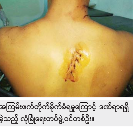
အကြမ်းဖက်တိုက်ခိုက်ခံရမှုကြောင့် ဒဏ်ရာရရှိ ခဲ့သည့် လုံခြုံရေးတာဝန်ထမ်းဆောင်သူတစ်ဦး။

အကြမ်းဖက်အဖွဲ့များအနေဖြင့် အမှားအမှန် ခွဲခြားသိမြင်နိုင်မှုနည်းပါးသေးသည့် အသက်ငယ်ရွယ် သူများကို ခြိမ်းခြောက်အကျပ်ကိုင်ခြင်း၊ စည်းရုံး မက်လုံးပေးသိမ်းသွင်းခြင်းများ ပြုလုပ်၍ ယခုကဲ့သို့ အကြမ်းဖက်လုပ်ရပ်များကို စေခိုင်းလျက်ရှိကြောင်း၊ အုပ်ထိန်းသူ မိတာ၊ ဆရာများကလည်း မိမိရင်သွေး ငယ်များ လမ်းမှားပေါ် မရောက်ရှိစေရေး ဝိုင်းဝန်း တားဆီးဆောင်ရွက်ရန်လိုကြောင်းနှင့် ကျောင်းသား၊ ကျောင်းသူများ စိတ်အေးချမ်းပျော်ရွှင်စွာ ပညာ သင်ကြားနိုင်ရေး လုံခြုံရေးတာဝန်ထမ်းဆောင်သူများက လိုအပ် သည့် လုံခြုံရေးလုပ်ငန်းများ ဆက်လက်ဆောင်ရွက် လျက်ရှိကြောင်း သတင်းရရှိသည်။ သတင်းစဉ်