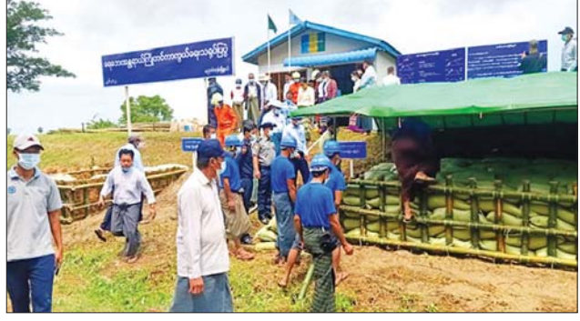
တာပေါ်ရေကျော်ခြင်းအတွက် သဲအိတ်ဆင့်ခြင်းဆောင်ရွက်မှု သရုပ်ပြနေစဉ်။

အလားတူ သောက်သုံးရေလိုအပ်ချက်အတွက် မန္တလေးတိုင်းဒေသကြီးတွင် တောင်ဇင်းချောင်း၊ ဘောလုံးကျွန်းချောင်းနှင့် စိတ္တိန်းချောင်းများတွင် မြေအောက်တမံများ တည်ဆောက်၍ လည်းကောင်း၊ စာမျက်နှာ ၂၁ သို့