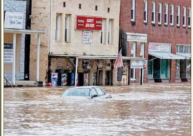
အီရန်နိုင်ငံ၌ ရေကြီးရေလျှံမှုဖြစ်ပွားနေသည်ကို တွေ့ရစဉ်။