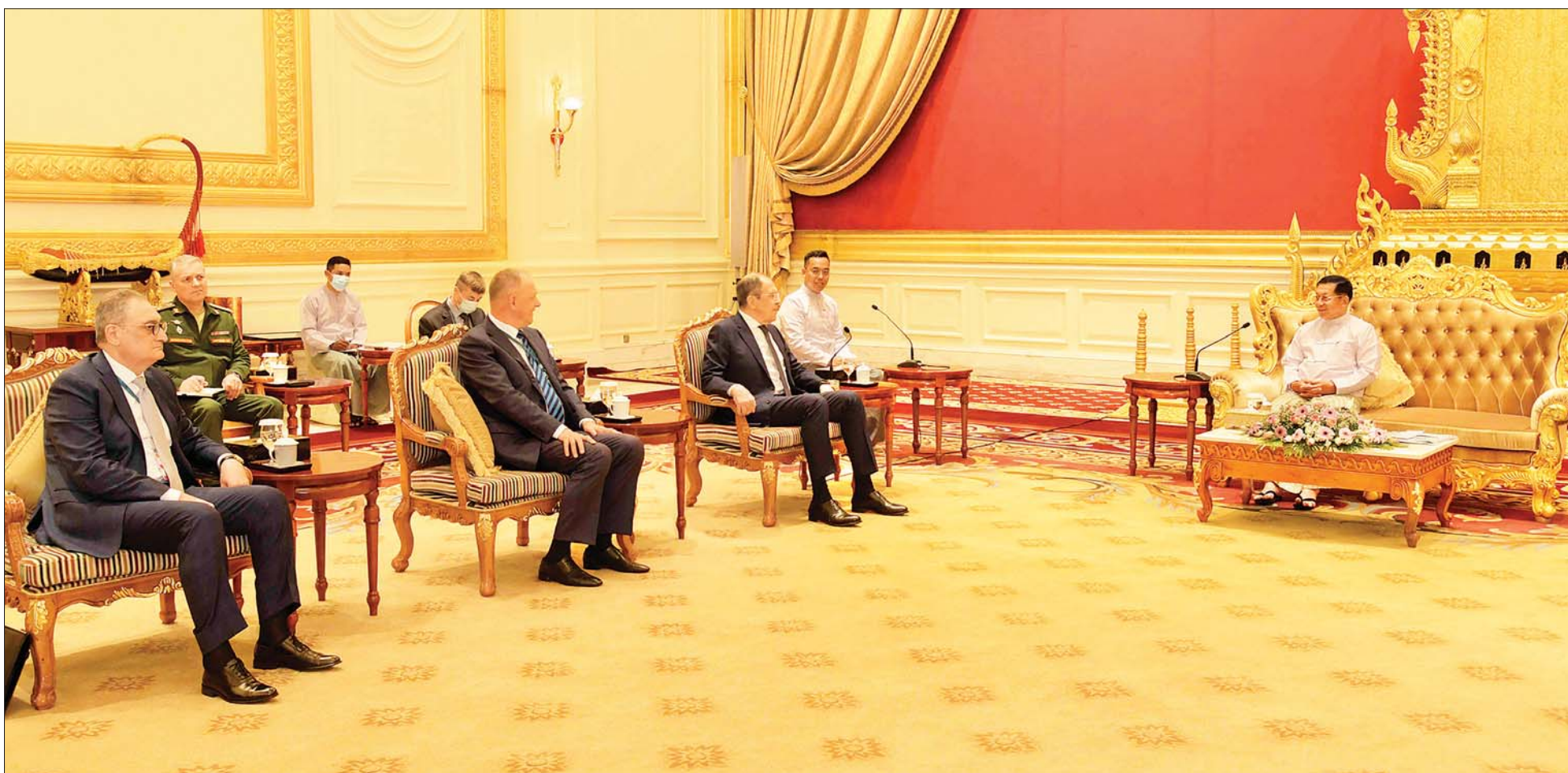
နိုင်ငံတော်စီမံအုပ်ချုပ်ရေးကောင်စီဥက္ကဋ္ဌ နိုင်ငံတော်ဝန်ကြီးချုပ် ဗိုလ်ချုပ်မှူးကြီး မင်းအောင်လှိုင် ရှုရှားဖက်ဒရေးရှင်းနိုင်ငံ နိုင်ငံခြားရေးဝန်ကြီး H.E. Sergey Lavrov ကို လက်ခံတွေ့ဆုံစဉ်။

၄။ တစ်နိုင်ငံလုံး ထာဝရငြိမ်းချမ်းရေးရရှိရေးအတွက် တစ်နိုင်ငံလုံး ပစ်ခတ်တိုက်ခိုက်မှုရပ်စဲရေး သဘောတူစာချုပ် (NCA) ပါ သဘောတူညီချက်များအတိုင်း ဖြစ်နိုင်သမျှ အလေးထား လုပ်ဆောင်သွားမည်။ ၅။ အရေးပေါ်ကာလဆိုင်ရာ ပြဋ္ဌာန်းချက်များနှင့်အညီ ဆောင်ရွက်ပြီးစီးပါက ဖွဲ့စည်းပုံအခြေခံဥပဒေ (၂၀၀၈ ခုနှစ်)နှင့်အညီ လွတ်လပ်ပြီး တရားမျှတသော ပါတီစုံဒီမိုကရေစီ အထွေထွေရွေးကောက်ပွဲအား ပြန်လည်ကျင်းပ၍ အနိုင်ရသည့်ပါတီအား ဒီမိုကရေစီစံနှုန်းများနှင့်အညီ နိုင်ငံတော်တာဝန်အား လွှဲအပ်နိုင်ရေး ဆက်လက်ဆောင်ရွက်သွားမည်။