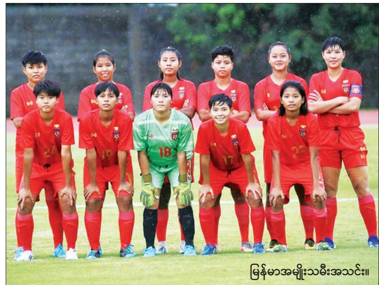
မြန်မာအမျိုးသမီးအသင်း။

နေပြည်တော် ဩဂုတ် ၃ NUG အမည်ခံအကြမ်းဖက်အဖွဲ့နှင့် ၎င်း၏လက်အောက်ခံ PDF အမည်ခံ အကြမ်းဖက်သမားများသည် အနာဂတ်လူငယ်များ၏ ပညာသင်ကြားသင်ယူခွင့် အခွင့်အလမ်းများ ပျက်ပြား၍ ပညာမဲ့လူတန်းစားများ ဖြစ်ပေါ်လာစေရန်နှင့် ၎င်းတို့အား အကြောက်တရားဖြင့် ထောက်ခံအားပေးလာစေရန် ယုတ်မာ ရိုင်းစိုင်းသော ရည်ရွယ်ချက်များဖြင့် ကျောင်းသား၊ ဆရာ၊ မိဘများအား ခြိမ်းခြောက်အကျပ်ကိုင်ခြင်း၊ ဖမ်းဆီးသတ်ဖြတ် ခြင်း၊ ပညာရေးဆိုင်ရာ အဆောက်အအုံများအား မီးရှို့ဖျက်ဆီး ခြင်း။ စာမျက်နှာ ၉ ကော်လံ ၁