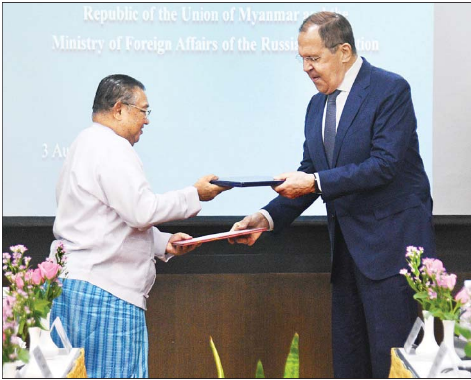
မြန်မာ-ရုရှား နှစ်နိုင်ငံ နိုင်ငံခြားရေးဝန်ကြီးဌာနများအကြား ညှိနှိုင်းဆွေးနွေးပွဲ အစီအစဉ် (၂၀၂၂-၂၀၂၄) ကို ပြည်ထောင်စုဝန်ကြီး ဦးဝဏ္ဏမောင်လွင်နှင့် ရုရှား နိုင်ငံခြားရေး ဝန်ကြီး H.E. Mr. Sergey Lavrov တို့ လက်မှတ်ရေးထိုးလဲလှယ်ကြစဉ်။