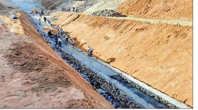
ဝါခင်းကြီးချောင်း မြေအောက်တမံတည်ဆောက်နေစဉ်။