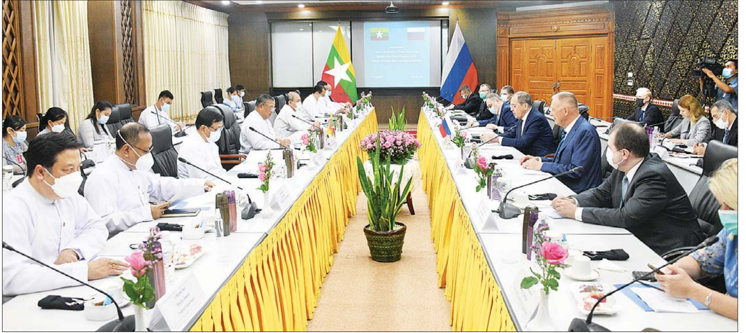
မြန်မာ-ရုရှား နှစ်နိုင်ငံ နိုင်ငံခြားရေးဝန်ကြီးဌာနများအကြား ဆွေးနွေးပွဲကျင်းပစဉ်။

ယင်းနောက် မြန်မာ-ရုရှား နှစ်နိုင်ငံ နိုင်ငံခြားရေးဝန်ကြီးဌာနများအကြား ဆွေးနွေးပွဲကို နိုင်ငံခြားရေး