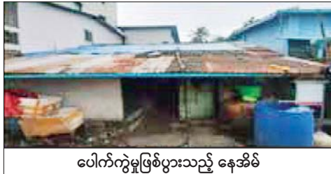
ပေါက်ကွဲမှုဖြစ်ပွားသည့် နေအိမ်