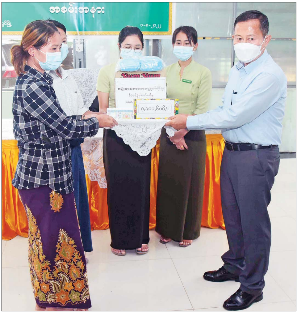
နိုင်ငံတော်စီမံအုပ်ချုပ်ရေးကောင်စီ ဒုတိယဥက္ကဋ္ဌ အမျိုးသားသဘာဝဘေးအန္တရာယ်ဆိုင်ရာစီမံခန့်ခွဲမှုကော်မတီဥက္ကဋ္ဌ ဒုတိယတပ်မတော်ကာကွယ်ရေးဦးစီးချုပ် ကာကွယ်ရေးဦးစီးချုပ် (ကြည်း) ဒုတိယဗိုလ်ချုပ်မှူးကြီး စိုးဝင်း ရေဘေးသင့်ပြည်သူများအတွက် ထောက်ပံ့ငွေများ ပေးအပ်ရာ တာဝန်ရှိသူများက လက်ခံရယူစဉ်။

ယခုကဲ့သို့ ရေကြီးရေလျှံမှုကို ကာကွယ်နိုင်ရန် ကြိုတင်ပြင်ဆင်ရာတွင် တစ်ဦးချင်းအနေဖြင့် ကိုယ်ပိုင်အိမ်၊ ခြံဝင်းအတွင်းအပြင်များကို ကိုယ်စီတာဝန်ယူဆောင်ရွက်ရန်လိုအပ်ပြီး လမ်း၊ တံတား၊ ချောင်း၊ မြောင်းများနှင့်ပတ်သက်၍ သက်ဆိုင်ရာအုပ်ချုပ်ရေးအဖွဲ့အစည်းများနှင့် မြို့နယ်စည်ပင်သာယာရေးကော်မတီတို့က တာဝန်ယူ ဆောင်ရွက်သွားရန်လိုကြောင်း၊ လက်ရှိဖြစ်ပေါ်ခဲ့သည့် ရေကြီးရေလျှံမှု၏ နောက်ဆက်တွဲ ကယ်ဆယ်ရေးလုပ်ငန်းများနှင့် ကျန်းမာရေးစောင့်ရှောက်မှု လုပ်ငန်းများကို မြို့နယ်အဆင့်မှ တိုင်းဒေသကြီးအဆင့်အထိ ဆောင်ရွက်နိုင်သည်များကို ချက်ချင်းဆောင်ရွက်ပေးရန်လိုပြီး အခက်အခဲရှိသည်များကို နိုင်ငံတော်စီမံအုပ်ချုပ်ရေးကောင်စီသို့ တင်ပြဆောင်ရွက်သွားရန်လိုကြောင်း၊ ယခုကဲ့သို့ မျှော်လင့်မထားသော သဘာဝဘေးအန္တရာယ်အား ဆုံးရှုံးမှုအနည်းဆုံးဖြင့် အချိန်တိုအတွင်း ကူညီကယ်ဆယ်ရေးလုပ်ငန်းများ ကောင်းမွန်