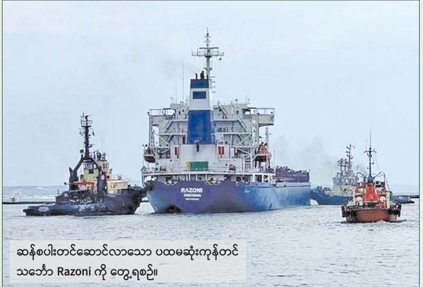
ဆန်စပါးတင်ဆောင်လာသော ပထမဆုံးကုန်တင် သင်္ဘော Razoni ကို တွေ့ရစဉ်။