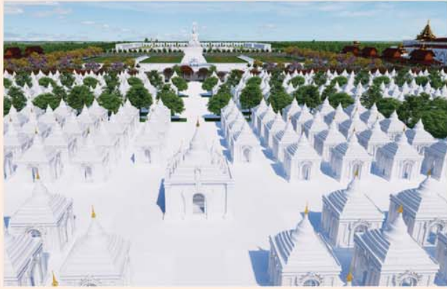
ကျောက်စာရုံစေတီ(၁၂ x ၁၂ x ၁၈)ပေ ၁ ဆူ တန်ဖိုး- ၂၇၉ သိန်း