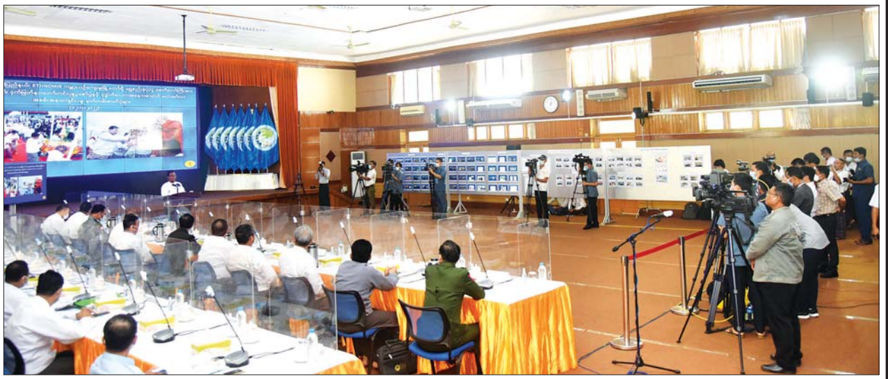
(၁၈)ကြိမ်မြောက် သတင်းစာရှင်းလင်းပွဲကို ဇူလိုင် ၂၆ ရက် မွန်းလွဲပိုင်းတွင် ပြန်ကြားရေးဝန်ကြီးဌာန၌ ကျင်းပပြုလုပ်ရာ သတင်းမီဒီယာ သမားများက သတင်းမှတ်တမ်းဓာတ်ပုံများ ရိုက်ကူးရယူစဉ်။

ဗိုလ်ချုပ်ဇော်မင်းထွန်းက ဆိုးကျိုးက ပိုက်ဆံကုန်ပါကြောင်း၊ နိုင်ငံတကာ တရားရုံးများတွင် ပြည်တွင်းဥပဒေကဲ့သို့ ပုဒ်မ မရှိပါကြောင်း၊ တိကျသည့်ပြဋ္ဌာန်းချက်များမရှိပါကြောင်း၊ ယင်းတို့အခြေပြုရသည်မှာ ယခင်စီရင်ထုံးများကိုအခြေပြုကြောင်း၊ ပညာရှင်များ၏ အဆိုအမိန့်များကို အခြေပြုကြောင်း၊ ဥပဒေပညာရှင်များ၏ စာအုပ်များကို အခြေပြုခြင်းဖြစ်ကြောင်း၊ အဘယ်ကြောင့် မည်သို့အရေးယူသည်ဟု မရှိပါကြောင်း၊ နောက်ပိုင်းတွင် ချဲ့ထွင်မှု ရှိကောင်းရှိနိုင်ပါကြောင်း၊ မြန်မာနိုင်ငံအနေဖြင့် ဂမ်ဘီယာနိုင်ငံက နိုင်ငံချင်းတရားစွဲခြင်းဖြစ်ကြောင်း၊ ဂမ်ဘီယာနိုင်ငံက တရားစွဲရာတွင် မိမိတို့အနေဖြင့် အချက်(၄)ချက်ဖြင့် တရားစွဲခွင့်မရှိဟု ပြောခဲ့ပါကြောင်း၊ အနစ်ချုပ်ဆိုရလျှင် မြန်မာနိုင်ငံနှင့် ဂမ်ဘီယာနိုင်ငံသည် အလှမ်းဝေးသည့် နိုင်ငံဖြစ်ပါကြောင်း၊ မြန်မာနိုင်ငံတွင် ဖြစ်ပျက်နေသည့်အကြောင်းအရာသည် ဂမ်ဘီယာနိုင်ငံအပေါ် မည်သို့မျှ အကျိုးမသက်ရောက်ပါကြောင်း၊ ဂမ်ဘီယာနိုင်ငံအနေဖြင့် နစ်နာသွားခြင်းမရှိခြင်းကြောင့် တရားစွဲဆိုပိုင်ခွင့်မရှိဟု ပြောခဲ့ပါကြောင်း၊ ယင်းတို့ကရှိသည်ဟု လုပ်ပါကြောင်း၊ ထို့ကြောင့် ယင်းကစီရင်ထုံးတစ်ခုဖြစ်သွားပြီဟုဆိုလျှင်၊ စီရင်ထုံးသည် တစ်ကမ္ဘာလုံးအပေါ် သက်ရောက်ပါကြောင်း၊ ဥပမာ မိမိပြောလိုကြောင်း၊ အမေရိကန်ကို ယခင်က တရားစွဲခဲ့ရာမှာ ပြောကြားကြောင်း၊ အမေရိကန်က အီရတ်ကို တိုက်ခိုက်သည့်ကိစ္စနှင့်ပတ်သက်ပြီး မြန်မာနိုင်ငံက တရားစွဲမည်ဆိုပါက မဖြစ်နိုင်ဘူးလား၊ ထိုအရာသည် စီရင်ထုံးဖြစ်ပါကြောင်း၊ ဥပမာအားဖြင့် နားလည်လွယ်အောင်ပြောခြင်း ဖြစ်