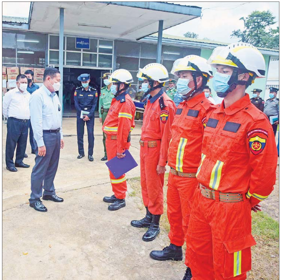
နိုင်ငံတော်စီမံအုပ်ချုပ်ရေးကောင်စီ ဒုတိယဥက္ကဋ္ဌ အမျိုးသားသဘာဝဘေးအန္တရာယ်ဆိုင်ရာစီမံခန့်ခွဲမှုကော်မတီဥက္ကဋ္ဌ ဒုတိယတပ်မတော်ကာကွယ်ရေးဦးစီးချုပ် ကာကွယ်ရေးဦးစီးချုပ် (ကြည်း) ဒုတိယဗိုလ်ချုပ်မှူးကြီး စိုးဝင်း ကူညီကယ်ဆယ်ရေးအဖွဲ့များအား ရင်းရင်းနှီးနှီးနှုတ်ဆက်အားပေးစဉ်။

ဆက်လက်၍လည်း ရေကြီးရေလျှံသည့် ရပ်ကွက်များမှ ပြည်သူများ၊ အစိုးရအဖွဲ့၊ လုံခြုံရေးတပ်ဖွဲ့ဝင်များနှင့် ဌာနဆိုင်ရာ ဝန်ထမ်းများ စုပေါင်းလျက် ရပ်ကွက်အလိုက် သန့်ရှင်းသာယာလှပရေး ပိုင်းဝန်းဆောင်ရွက်လျက်ရှိကြောင်း သတင်းရရှိသည်။ သတင်းစဉ်