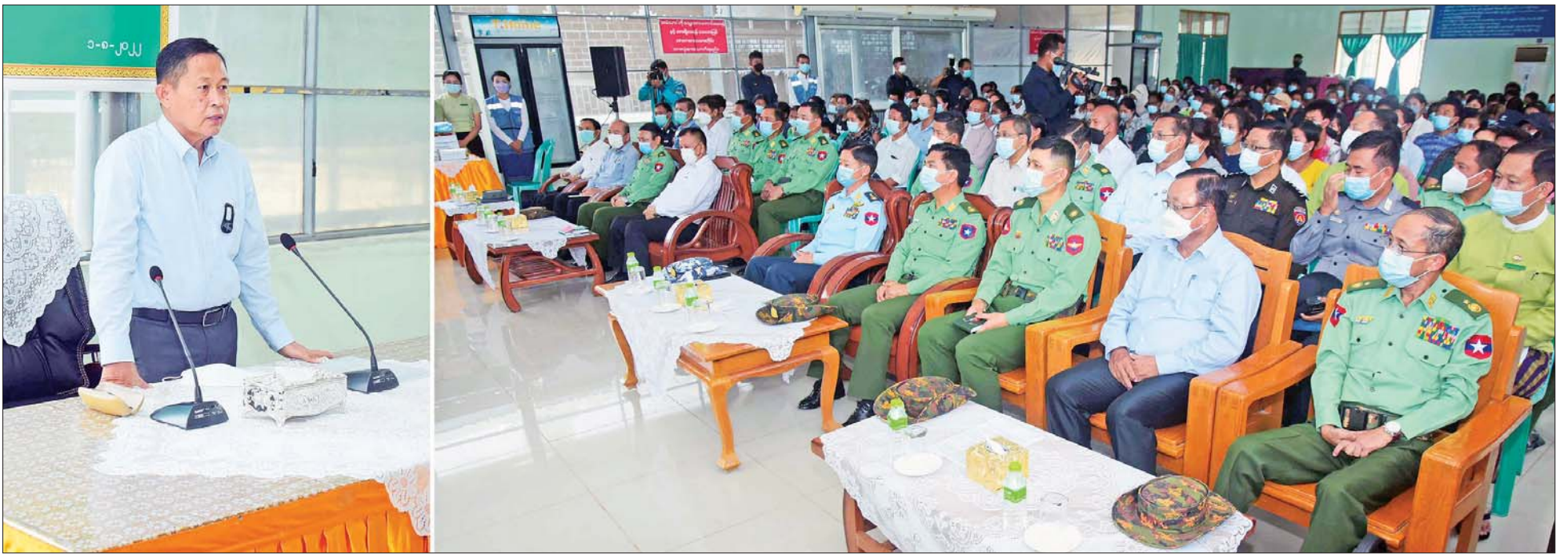
နိုင်ငံတော်စီမံအုပ်ချုပ်ရေးကောင်စီ ဒုတိယဥက္ကဋ္ဌ အမျိုးသားသဘာဝဘေးအန္တရာယ်ဆိုင်ရာစီမံခန့်ခွဲမှုကော်မတီဥက္ကဋ္ဌ ဒုတိယတပ်မတော် ကာကွယ်ရေးဦးစီးချုပ် ကာကွယ်ရေး ဦးစီးချုပ်(ကြည်း) ဒုတိယဗိုလ်ချုပ်မှူးကြီး စိုးဝင်း ပြင်ဦးလွင်မြို့ တပ်နယ်ခန်းမတွင် တာဝန်ရှိသူများနှင့် တွေ့ဆုံစဉ်။