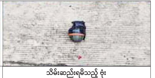
သိမ်းဆည်းရမိသည့် ဗုံး

နှစ်ဦး၏ ရုပ်အလောင်းများကို သင်္ဘန်းကျွန်းမြို့နယ် နှင့်အညီ ဆက်လက်ဆောင်ရွက်လျက်ရှိကြောင်း ပြည်သူ့ဆေးရုံကြီးသို့ ပို့ဆောင်ထားရှိခဲ့ပြီး လိုအပ် သောလုပ်ငန်းများအား ဥပဒေလုပ်ထုံးလုပ်နည်းများ သတင်းစဉ်