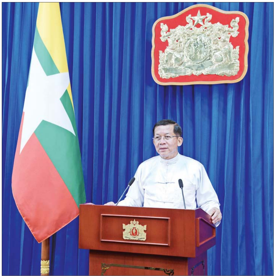
နိုင်ငံတော်စီမံအုပ်ချုပ်ရေးကောင်စီဥက္ကဋ္ဌ နိုင်ငံတော်ဝန်ကြီးချုပ် ဗိုလ်ချုပ်မှူးကြီး မင်းအောင်လှိုင် နိုင်ငံတော်စီမံအုပ်ချုပ်ရေးကောင်စီ၏ ၁ နှစ်နှင့် ၆ လ(၁၈ လ)ပြည့် နိုင်ငံတော်တာဝန် ထမ်းဆောင်ခဲ့မှုနှင့်ပတ်သက်၍ မိန့်ခွန်းပြောကြားစဉ်။

တိုင်းရင်းသားပြည်သူများခင်ဗျား- ကျွန်တော်တို့ နိုင်ငံတော်စီမံအုပ်ချုပ်ရေးကောင်စီအစိုးရအနေနဲ့ နိုင်ငံတော်တာဝန်ကို ထမ်းဆောင်ခဲ့တာ ဒီနေ့ဆိုရင် ၁၈ လ (တစ်နှစ်နဲ့ ခြောက်လ) ပြည့်မြောက်တဲ့နေ့ပဲ ဖြစ်ပါတယ်။ တိုင်းရင်းသားပြည်သူလူထုအားလုံး ကျန်းမာရွှင်လန်းကြပါစေလို့ ဦးစွာဆုတောင်းမေတ္တာ ပို့သအပ်ပါတယ်ခင်ဗျား။ မနေ့က အမျိုးသားကာကွယ်ရေးနှင့်လုံခြုံရေးကောင်စီ အစည်းအဝေးကျင်းပပြီး နိုင်ငံတော်ရဲ့ အခြေအနေအရပ်ရပ်ကို အစီရင်ခံတင်ပြခဲ့ပါတယ်။ ဖွဲ့စည်းပုံအခြေခံဥပဒေပုဒ်မ ၄၂၅ အရ နိုင်ငံတော်စီမံအုပ်ချုပ်ရေးကောင်စီရဲ့ သက်တမ်းကို နောက်ထပ် ၆ လ တိုးမြှင့်သတ်မှတ်ခဲ့ပါတယ်။ ဒီနေ့မှာတော့ ကျွန်တော်တို့အစိုးရရဲ့ နိုင်ငံရေးနှင့်လုံခြုံရေးဆိုင်ရာ လုပ်ဆောင်ချက်များ၊ လူမှုရေးဆိုင်ရာ လုပ်ဆောင်ချက်များ၊ အမျိုးသားရေးလုပ်ငန်းစဉ်(၂)ရပ်နဲ့ စီးပွားရေးလုပ်ငန်းစဉ် (၂)ရပ်တို့ကို အကောင်အထည်ဖော် ဆောင်ရွက်နေမှုများနဲ့ ဆက်လက်ဆောင်ရွက်သွားမယ့် အခြေအနေများကို အသိပေးပြောကြားသွားပါမယ်။ တိုင်းရင်းသားပြည်သူများခင်ဗျား ဦးစွာ နိုင်ငံရေးနှင့် လုံခြုံရေးဆိုင်ရာဆောင်ရွက်ချက်များအနေနဲ့ တပ်မတော်အနေနဲ့ ၂၀၂၀ ရွေးကောက်ပွဲမှာ မဲမသမာမှုတွေရှိခဲ့လို့ဖြေရှင်းပေးနိုင်ဖို့တင်ပြမှုအပေါ် စာမျက်နှာ ၃ ကော်လံ ၁ ❖