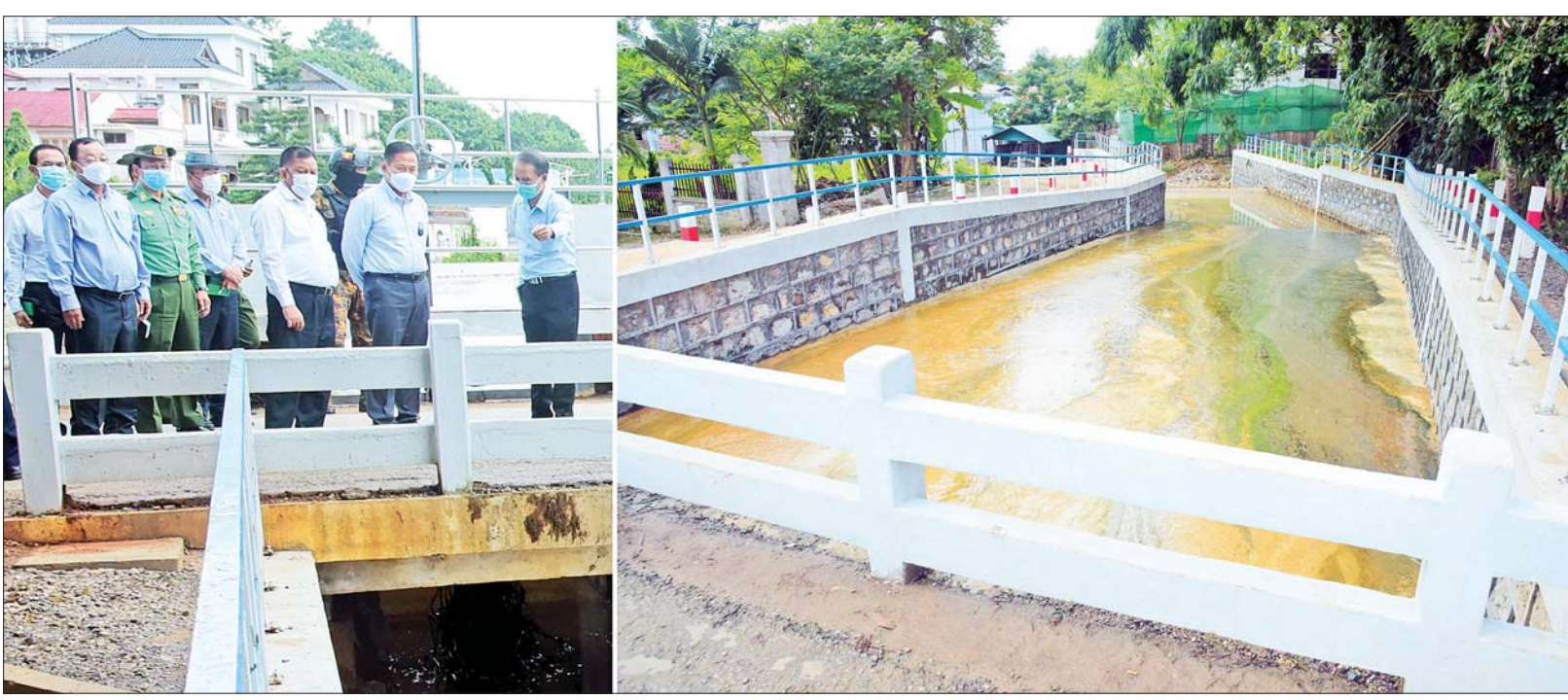
နိုင်ငံတော်စီမံအုပ်ချုပ်ရေးကောင်စီ ဒုတိယဥက္ကဋ္ဌ အမျိုးသားသဘာဝဘေးအန္တရာယ်ဆိုင်ရာစီမံခန့်ခွဲမှုကော်မတီဥက္ကဋ္ဌ ဒုတိယတပ်မတော် ကာကွယ်ရေးဦးစီးချုပ် ကာကွယ်ရေး ဦးစီးချုပ်(ကြည်း) ဒုတိယဗိုလ်ချုပ်မှူးကြီး စိုးဝင်းနှင့် အဖွဲ့ဝင်များ ပြင်ဦးလွင်မြို့ရှိ ကန်တော်လေး ရေထိန်းတံခါးကို ကြည့်ရှုစစ်ဆေးစဉ်။

နေပြည်တော် ဩဂုတ် ၁ နိုင်ငံတော် စီမံအုပ်ချုပ်ရေး ကောင်စီ ဒုတိယဥက္ကဋ္ဌ အမျိုးသား သဘာဝ ဘေးအန္တရာယ်ဆိုင်ရာ စီမံခန့်ခွဲမှုကော်မတီဥက္ကဋ္ဌ ဒုတိယ တပ်မတော်ကာကွယ်ရေး ဦးစီး ချုပ် ကာကွယ်ရေးဦးစီးချုပ် (ကြည်း) ဒုတိယဗိုလ်ချုပ်မှူးကြီး စိုးဝင်း သည် မန္တလေးတိုင်းဒေသ ကြီး ဝန်ကြီးချုပ် ဦးမောင်ကို၊ ကာကွယ်ရေးဦးစီးချုပ် ရုံးမှ တပ်မတော် အရာရှိကြီးများ၊ အလယ်ပိုင်းတိုင်း စစ်ဌာနချုပ် တိုင်းမှူး ဗိုလ်ချုပ် ကိုကိုဦး၊ ဒုတိယ ဝန်ကြီးများနှင့် တာဝန်ရှိသူများ လိုက်ပါ၍ ဇူလိုင် ၃၁ ရက်တွင် မိုးသည်းထန်စွာ ရွာသွန်းမှုကြောင့် စာမျက်နှာ ၈ ကော်လံ ၁ ၀