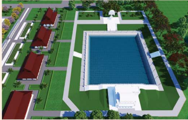
မုစလိန္နုအိုင်

၁။ နိုင်ငံတော်စီမံအုပ်ချုပ်ရေးကောင်စီဥက္ကဋ္ဌ၊ တပ်မတော်ကာကွယ်ရေးဦးစီးချုပ် ဗိုလ်ချုပ်မှူးကြီးမင်းအောင်လှိုင် ဦးဆောင်သည့် (၇)ရက်သား၊ သမီး၊ ဘုရားဒါယကာ၊ ဒါယိကာမတို့က မာရဝိဇယပုဒ္ဒရုပ်ပွားတော်မြတ်ကြီးအား မြန်မာနိုင်ငံတွင် ထေရဝါဒဗုဒ္ဓသာသနာတော်ထွန်းလင်းတောက်ပလျက်ရှိသည်ကို ကမ္ဘာကိုပြသရန်၊ တိုင်းပြည်အေးချမ်းသာယာမှုရှိစေရန်၊ ရုပ်ပွားတော် မြတ်ကြီးအား ပြည်တွင်း၊ ပြည်ပဘုရားဖူးများလာရောက်ခြင်းဖြင့် ဒေသတိုးတက်စည်ကားမှုကို အထောက်အကူဖြစ်စေရန်၊ နိုင်ငံတော်ဖွံ့ဖြိုးတိုးတက်မှုအား အထောက်အကူဖြစ်စေရန် ရည်သန်လျက် ပြည်ထောင်စုနယ်မြေ နေပြည်တော်၊ ဒဂုံဧကသီရိမြို့နယ်အတွင်း၌ သာသနာတော်ထုံး၊ ရုပ်ပွားဆင်းတုတော်ထုံး၊ မြန်မာ့ရိုးရာတည်ထုံးများနှင့်အညီ တည်ဆောက်ပူဇော်လျက် ရှိပါသည်။