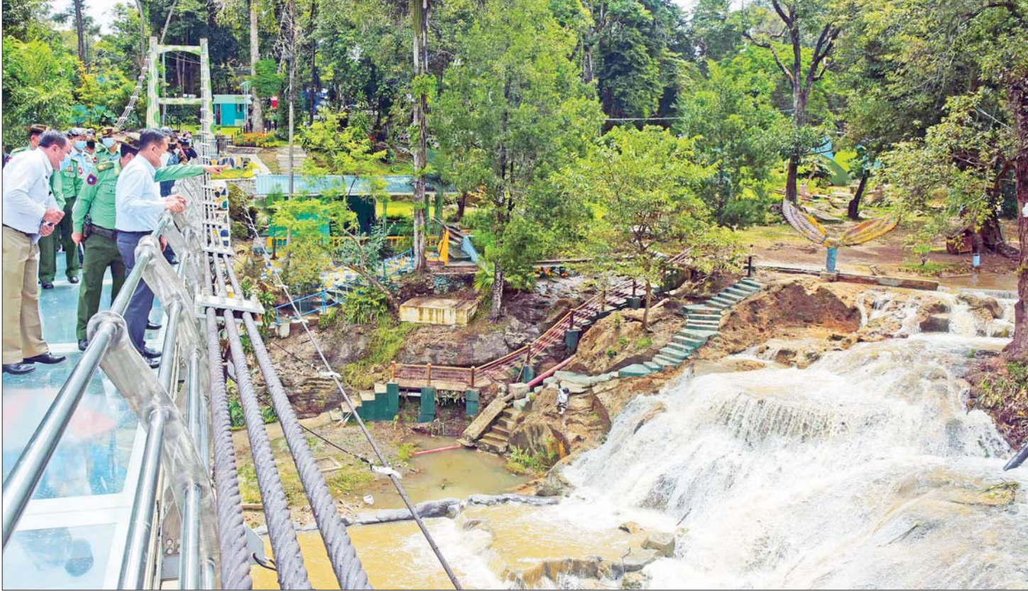
နိုင်ငံတော်စီမံအုပ်ချုပ်ရေးကောင်စီ ဒုတိယဥက္ကဋ္ဌ အမျိုးသားသဘာဝဘေးအန္တရာယ်ဆိုင်ရာစီမံခန့်ခွဲမှုကော်မတီဥက္ကဋ္ဌ ဒုတိယတပ်မတော် ကာကွယ်ရေးဦးစီးချုပ် ကာကွယ်ရေး ဦးစီးချုပ်(ကြည်း) ဒုတိယဗိုလ်ချုပ်မှူးကြီး စိုးဝင်းနှင့် အဖွဲ့ဝင်များ ရေကြီးရေလျှံမှုကြောင့် ပျက်စီးမှုများ ဖြစ်ပွားခဲ့သည့် ပွဲကောက်ရေတံခွန်ကို ကြည့်ရှုစဉ်။

နှစ်ပေါင်း ၃၀ အတွင်း စံချိန်တင်မိုးရွာသွန်း ဆက်လက်၍ နိုင်ငံတော်စီမံအုပ်ချုပ်ရေးကောင်စီ ဒုတိယဥက္ကဋ္ဌ အမျိုးသား သဘာဝဘေးအန္တရာယ်ဆိုင်ရာစီမံခန့်ခွဲမှုကော်မတီဥက္ကဋ္ဌ ဒုတိယတပ်မတော်ကာကွယ်ရေးဦးစီးချုပ် ကာကွယ်ရေးဦးစီးချုပ် (ကြည်း)နှင့် အဖွဲ့ဝင်များသည် ပြင်ဦးလွင်မြို့ အားကစားခန်းမ၌ ရေကြီးနစ်မြုပ်ဒဏ်ခံရသည့် ရေဘေးသင့်ပြည်သူ ၂၅၀ ခန့်အား တွေ့ဆုံ၍ အားပေးစကားပြောကြားရာတွင် ယခုဖြစ်ပေါ်မူသည့် ပြင်ဦးလွင်မြို့တွင် နှစ်ပေါင်း ၃၀ အတွင်း စံချိန်တင်မိုးရွာသွန်းမှုဖြစ်ပေါ်ခဲ့၍ စာမျက်နှာ ၉ ညို့