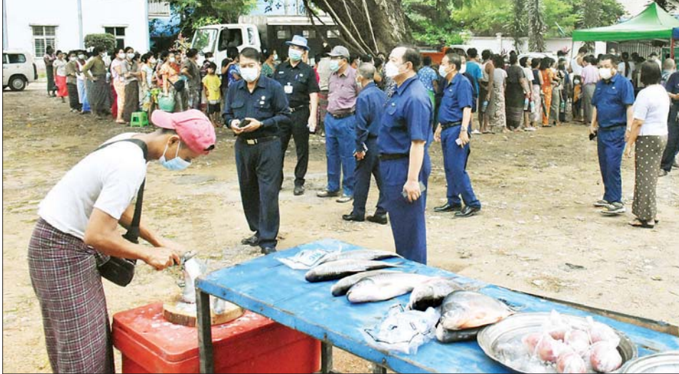
ကြည့်ရှုစစ်ဆေးပြီး (အပေါ်ပုံ) များ၊ အသိပေးချက်များကို များ ဝေငှသည်။ ကျန်းမာရေး ဝန်ကြီးဌာနက လိုက်နာ၍ ဈေးရောင်း/ဈေးဝယ် ဆက်လက်၍ မြို့တော်ဝန်နှင့် ထုတ်ပြန်ထားသော ညွှန်ကြားချက် ပြုလုပ်ကြရန် မှာကြားပြီး Mask အဖွဲ့သည် မအူကုန်းအိမ်ရာဝင်း သတင်းစဉ်

ရန်ကုန် ဇူလိုင် ၃၁ ရန်ကုန်တိုင်းဒေသကြီး စည်ပင်သာယာရေးဝန်ကြီး၊ ရန်ကုန်မြို့တော် စည်ပင်သာယာရေးကော်မတီဥက္ကဋ္ဌ (မြို့တော်ဝန်) ဦးဗိုလ်ဌေးသည် အတွင်းရေးမှူးဦးညွန့်ဖေနှင့်အတူ ယနေ့ နံနက်ပိုင်းက မင်္ဂလာတောင်ညွန့်မြို့နယ် စက်ရုံလမ်းရှိ မအူကုန်းစည်ပင်ဝန်ထမ်းအိမ်ရာဝင်းအတွင်း ရွေ့လျားဈေးကား (Mobile Market) စနစ်ဖြင့် ကုန်စိမ်း၊ ကုန်ခြောက်မျိုးစုံ၊ အသားမျိုးစုံနှင့် ငါး/ပုစွန်အမျိုးမျိုးတို့ကို ဈေးနှုန်းသက်သာစွာဖြင့် ဝယ်ယူနိုင်ရန် ရောင်းချပေးနေမှုကို သွားရောက်