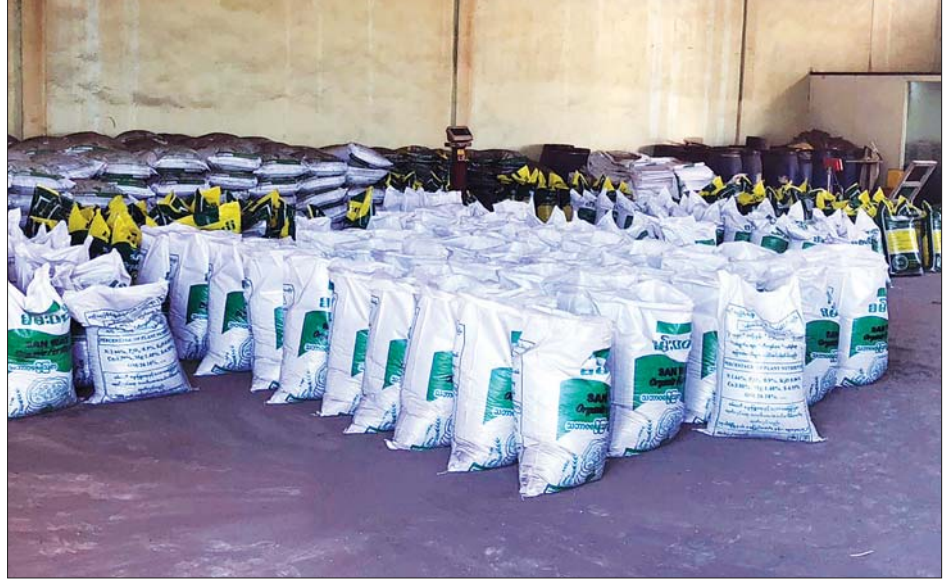
စမ်းဝတီ သမဝါယမနှင့် သဘာဝမြေဩဇာစက်ရုံမှ ထုတ်လုပ်သော မြေဩဇာအိတ်များ။

စမ်းဝတီသဘာဝမြေဩဇာ ထုတ်လုပ်ရေး လုပ်ငန်းမှ သဘာဝမြေဩဇာအိတ်များအပြင် သဘာဝ ရွက်ဖျန်းအားဆေးရည်၊ သဘာဝအသီးအပွင့် အားဆေးရည်၊ EM ဖျော်ရည်၊ ထုံးကန်ဆေးရည်၊ တီကျစ်စာအရည်၊ ငါးအမိုင်နိုအက်စစ်နှင့် တိုင်းရင်း အချဉ်ဖောက်ဆေးရည်တို့ကို စာမျက်နှာ ၁၁ သို့