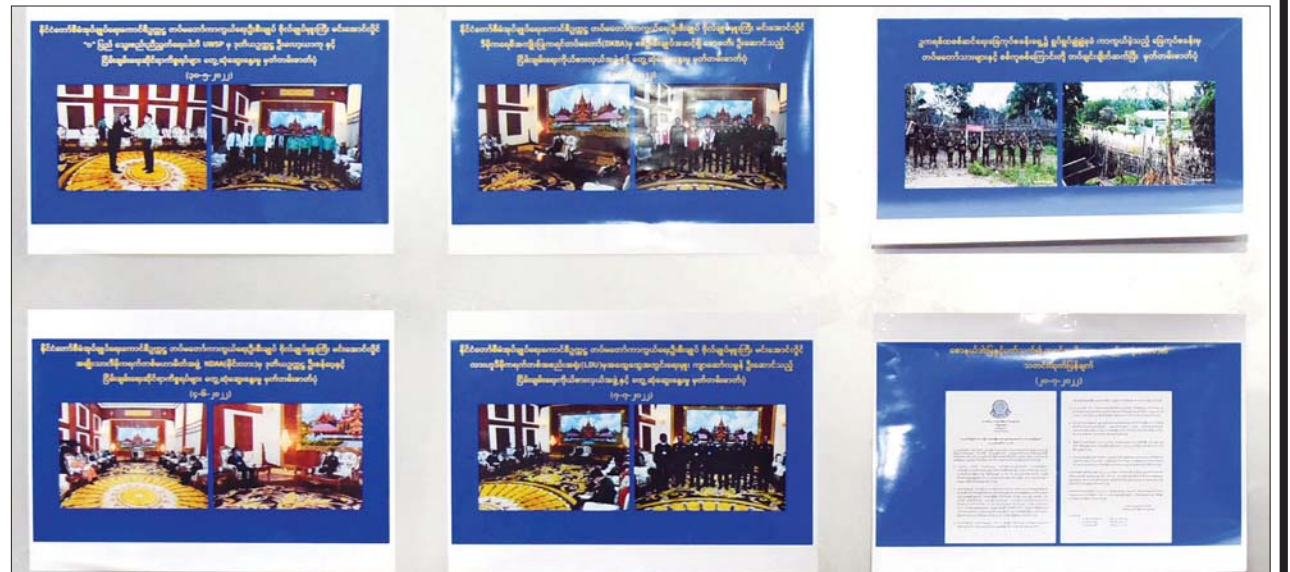
တိုင်းရင်းသားလက်နက်ကိုင်များဆိုင်ရာကိစ္စရပ်များနှင့် ပတ်သက်၍ သတင်းစာရှင်းလင်းပွဲတွင် ပြသထားသည့် မှတ်တမ်းဓာတ်ပုံများ။

Myanmar Hard Talk သတင်းဌာနမှ အယ်ဒီတာ ဦးဌက္ကာက မိမိမေးမြန်းမည့်မေးခွန်းတွင် အချက် သုံးချက်ရှိကြောင်း၊ နံပါတ်(၁) အချက်မှာ ဗဟိုဘဏ်က ဒေါ်လာငွေများကို ချုပ်ကိုင်လာခြင်းနှင့် နိုင်ငံခြားကြေးမြီများကို ပြန်ဆပ်ရန် ဆိုင်းငံ့ခိုင်းခြင်းနှင့် ပတ်သက်ပြီး မည်သည့်အတွက်ကြောင့်ဖြစ်သည်ကို ပြည်သူလူထု ကျယ်ကျယ်ပြန့်ပြန့်သိရှိစေရန် ဖြေကြားစေလိုကြောင်း၊ နံပါတ်(၂) အချက်မှာ မြန်မာနိုင်ငံသည် သီရိလင်္ကာနိုင်ငံကဲ့သို့ ဖြစ်လာနိုင်သည်ဟု ကောလဟာလများထွက်နေကြောင်း၊ ယင်းကိစ္စနှင့် ပတ်သက်ပြီး