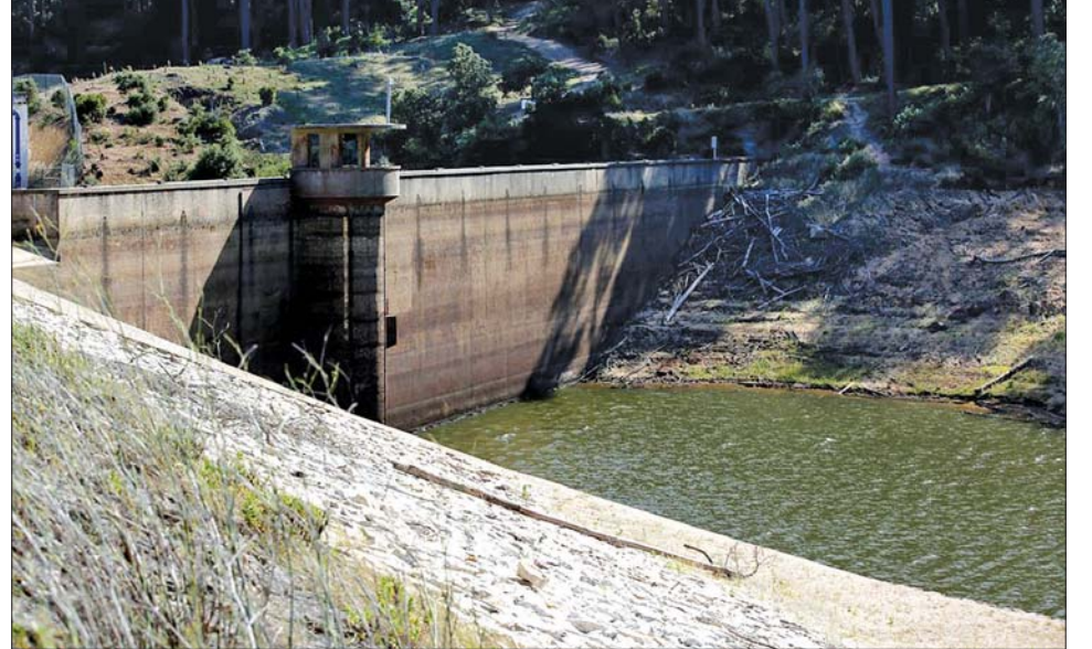
ပေါ်တူဂီနိုင်ငံ ကက်စ်ကားစ်ရှိ ရီယိုဒါမူလာ ရေလှောင်တံ၏ ရေမျက်နှာပြင် နိမ့်ကျနေမှုကို တွေ့ရစဉ်။

လစ္စဘွန်း ဇူလိုင် ၃၁ ပေါ်တူဂီနိုင်ငံ၏ နယ်မြေ ၆၇ ဒသမ ၉ ရာခိုင်နှုန်းသည် အဆိုး ရွားဆုံး မိုးခေါင်မှုနှင့် ကြုံတွေ့နေ ရပြီး ၂၈ ဒသမ ၄ ရာခိုင်နှုန်းသည် ပြင်းထန်သော မိုးခေါင်မှုနှင့် ကြုံတွေ့နေရကာ ကျန် ၃ ဒသမ ၇ ရာခိုင်နှုန်းသည် အသင့်အတင့် မိုးခေါင်မှုနှင့် ကြုံတွေ့နေရကြောင်း ပေါ်တူဂီ ပင်လယ်နှင့် လေထု ဆိုင်ရာ ဌာနက ဇူလိုင် ၃၁ ရက် တွင် ပြောသည်။ ပေါ်တူဂီနိုင်ငံ၌ ၁၉၃၁ ခုနှစ် က မိုးခေါင်မှုနှင့်ပတ်သက်ပြီး စတင်မှတ်တမ်း ကောက်ယူချိန် နောက်ပိုင်း ယခုနှစ်သည် အခြောက် သွေဆုံးနှစ်ဖြစ်ကြောင်း အဆို ပါ ဌာနက ပြောသည်။ ပေါ်တူဂီ နိုင်ငံ၌ အဆိုပါ မိုးခေါင်မှုသည် လွန်ခဲ့သည့် တစ်နှစ်ခန့်မှစကာ ပြင်းထန်လာခဲ့ပြီး ဆောင်းရာသီ တွင်ပင် နိုင်ငံတစ်ဝန်း ပြင်းထန် သော မိုးခေါင်မှုဒဏ်နှင့် ကြုံတွေ့ နေရကြောင်း သိရသည်။ ထို့အပြင် ပေါ်တူဂီနိုင်ငံ၌ အလွန်ပြင်းထန်သော အပူချိန် ပြည်သူများ ရေသုံးစွဲမှု အစိုးရသည် ရေလှောင်ကန်များ ဆက်လက်တည်ရှိနေခြင်းကြောင့် လုံလောက်ရန်အတွက် ပေါ်တူဂီ ခရိုင်ငါးခုတွင် ဩဂုတ် ၁ ရက်အထိ အစိုးရသည် စွမ်းအင်ထုတ်လုပ်မှု ရေစုဆောင်းမှုကို ဖြည့်တင်းရန်နှင့် ဒုတိယမြောက် အပြင်းထန်ဆုံး နှင့် ဆည်မြောင်းအတွက် ရေသုံး ဆည်မြောင်းအတွင်း ရေချွေတာ လီမ္မိတ်ရောင် အဆင့်အောက် စွဲမှုကိုစောင့်ကြည့်ရန်နှင့် ကန့်သတ် ရန် အစီအမံများ ချမှတ်ခဲ့ကြောင်း ရန် အစီအမံများ ချမှတ်ခဲ့ကြောင်း သိရသည်။ ထို့အပြင် ပေါ်တူဂီ ကြောင်း သိရသည်။ ဆင်ဟွာ