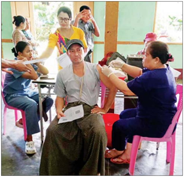
သံတွဲမြို့နယ်၌ ဒေသခံပြည်သူများအား ကိုဗစ်-၁၉ ကာကွယ်ဆေး ထိုးနှံပေးစဉ်။

ယင်းသို့ ဆောင်ရွက်ပေးနေမှုများကို သက်ဆိုင်ရာ တိုင်းဒေသကြီး နှင့် ပြည်နယ်များမှ တာဝန်ရှိသူများက သွားရောက်ကြည့်ရှုအားပေးပြီး လိုအပ်သည်များ ညှိနှိုင်းဆောင်ရွက်ပေးကြကြောင်း သတင်းရရှိ သတင်းစဉ်