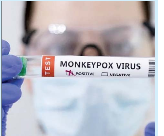
စပိန်နိုင်ငံ၌ မျောက်ကျောက်ရောဂါ ကူးစက်ခံရသူ၏ ပျမ်းမျှ အသက်အရွယ်သည် ၃၇ နှစ်ဖြစ်ကြောင်း သိရသည်။

မက်ဒရစ် ဇူလိုင် ၃၁ စပိန်နိုင်ငံတွင် မျောက်ကျောက်ရောဂါ ဗိုင်းရပ်စ်ကြောင့် ဒုတိယ မြောက် သေဆုံးမှုကို ဇူလိုင် ၃၀ ရက်တွင် ကျန်းမာရေးဝန်ကြီးဌာန အတည်ပြုပြောသည်။ စပိန်နိုင်ငံ၌ အဆိုပါ ဒုတိယမြောက် သေဆုံးမှုသည် ဇူလိုင် ၂၉ ရက် ညနေပိုင်းက ပထမဆုံး မျောက်ကျောက်ရောဂါ ကြောင့် သေဆုံးကြောင်း ကျန်းမာရေးဝန်ကြီးဌာနက အစီရင်ခံပြီး နောက် ၂၄ နာရီအကြာတွင် ထွက်ပေါ်လာခြင်းဖြစ်သည်။ ထို့အပြင် အဆိုပါသေဆုံးမှုသည် ဥရောပဒေသ၌ မျောက်ကျောက်ရောဂါဖြင့် ဒုတိယမြောက် သေဆုံးမှုဖြစ်ကြောင်းလည်း သိရသည်။ သို့သော်လည်း သေဆုံးသူသည် မည်သူမည်ဝါဖြစ်ကြောင်း ထုတ်ဖော်ပြောကြားခြင်းမရှိပေ။ ပထမဆုံးသေဆုံးသူသည် စပိန် နိုင်ငံအရှေ့ပိုင်း ဗယ်လင်စီယာနာဒေသတွင် နေထိုင်သူဖြစ်ပြီး ရောဂါ ပိုးနှင့်ဆက်စပ်သော ဦးနှောက်ရောင်ရောဂါဖြင့် သေဆုံးကြောင်း သိရသည်။ စပိန်နိုင်ငံ၌ အတည်ပြုမျောက်ကျောက်ရောဂါ ကူးစက် ခံရသူ ၄၂၉၈ ဦး အထိရှိပြီး အမျိုးသမီး ၆၄ ဦး ပါဝင်ကြောင်း အဆိုပါ ကူးစက်ခံရသူများထဲမှ ၁၂၀ သည် ဆေးရုံတွင် ဆေးကုသမှုခံယူရန် လိုအပ်ကြောင်း သိရသည်။