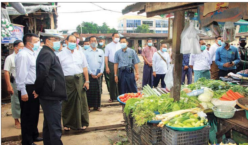
ခဲပြီး ကျောက်တွင်းကုန်လမ်းသည် အမြန်လမ်းနှင့် ကျူးနှင့် ဆက်စပ်နေ၍ ကျူးဘေးတစ်လျှောက် ချိတ်ဆက်မည့် လမ်းမကြီးဖြစ်ပြီး လမ်းချဲ့ခြင်း အစဉ်အမြဲ သန့်ရှင်းသပ်ရပ်စေရေး ဆောင်ရွက်ရန် လုပ်ငန်းများ ဆောင်ရွက်သွားမည်ဖြစ်၍ လမ်းဘေးဝဲ/ တာဝန်ရှိသူများအား မှာကြားကြောင်း သတင်းရရှိ ယာ ကျူးကျော်မှုမရှိစေရေး၊ ဟံသာဝတီရေးဟောင်း သတင်းစဉ်

ပဲခူး ဇူလိုင် ၃၁ ပဲခူးတိုင်းဒေသကြီးဝန်ကြီးချုပ် ဦးမျိုးဆွေဝင်းသည် အစိုးရအဖွဲ့ တာဝန်ရှိသူများနှင့်အတူ ဇူလိုင် ၃၀ ရက် နံနက်ပိုင်းက ပဲခူးမြို့တွင်း ဈေးများ ပြန်လည်အဆင့်မြှင့်တင်ပေးနိုင်ရေး ကွင်းဆင်းကြည့်ရှုစစ်ဆေးခဲ့သည်။ ရှေးဦးစွာ တိုင်းဒေသကြီးဝန်ကြီးချုပ်သည် ပဲခူးမြို့ ဘုရားဈေးသို့ ရောက်ရှိခဲ့ရာ ဈေးရုံများ ပြန်လည်အဆင့်မြှင့်တင်ပေးနိုင်ရေး မြေပြင်သန့်ရှင်းရေးဆောင်ရွက်နေမှုအား ကြည့်ရှုစစ်ဆေးခဲ့ပြီး ဈေးအတွင်း ရေဝင်ရောက်မှုမရှိစေရေး၊ ရေစီးရေလာကောင်းမွန်စေရေး၊ ရေနုတ်မြောင်းများ ပိတ်ဆို့မှုမရှိစေရေး၊ ယာယီဈေးဆိုင်ခန်း နေရာချထားပေးနိုင်ရေး၊ ဈေးအတွင်း ကွန်ကရစ်လမ်းများ ခင်းရန်၊ ဈေးပတ်လမ်း ကျူးကျော်မှုမရှိစေရေးနှင့် ခြံစည်းရိုးကာရံနိုင်ရေး ဆောင်ရွက်ရန် တာဝန်ရှိသူများအား မှာကြားသည်။ ထို့နောက် တိုင်းဒေသကြီး ဝန်ကြီးချုပ်နှင့် အဖွဲ့သည် ပဲခူးမြို့ ဗဟိုကုန်စိမ်းသားငါးဈေးသို့ ရောက်ရှိခဲ့ပြီး ကားအဝင်/အထွက်လမ်းများ ကောင်းမွန်စေရေး၊ ဈေးအတွင်း သန့်ရှင်းသပ်ရပ်စေရေးနှင့် အမှိုက်သိမ်းစနစ် ကောင်းမွန်စေရေး တာဝန်ရှိသူများအား လမ်းညွှန်မှာကြားသည်။ ၎င်းနောက် ဝန်ကြီးချုပ်နှင့်အဖွဲ့သည် ပဲခူးမြို့ လိပ်ပြာကန် ပြန်လည်အဆင့်မြှင့်တင်နေမှုအား ကွင်းဆင်းကြည့်ရှုစစ်ဆေးခဲ့ပြီး အများပြည်သူ အပန်းဖြေနိုင်ရေး အရိပ်ရသစ်ပင်များ စနစ်တကျ စိုက်ပျိုးသွားရန်နှင့် ရေရှည်ထိန်းသိမ်းဆောင်ရွက်သွားရန် တာဝန်ရှိသူများအား မှာကြားခဲ့သည်။ ယင်းနောက် ဝန်ကြီးချုပ်နှင့်အဖွဲ့သည် ပဲခူးမြို့ ကျောက်တွင်းကုန်း အဝင်လမ်းဘေးတစ်လျှောက် ဌာနဆိုင်ရာဝန်ထမ်းများ၊ တပ်ရင်း/တပ်ဖွဲ့များနှင့် ရပ်ကွက်နေပြည်သူများ စုပေါင်းအားဖြင့် သန့်ရှင်းရေး ဆောင်ရွက်နေမှုများအား ကြည့်ရှုအားပေး