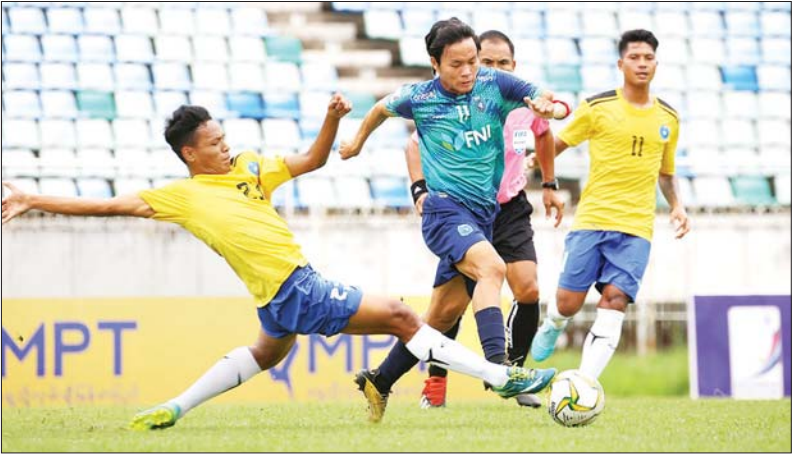
အား/ကာသိပွဲနှင့် ရန်ကုန်အသင်း ယှဉ်ပြိုင်နေစဉ်။

နာမည်ကြီး ရန်ကုန်ယူနိုက်တက်ထံမှ အား/ကာသိပွဲအသင်း အမှတ်ခွဲယူ ရန်ကုန် ဇူလိုင် ၃၁ ၂၀၂၂ ရာသီ MNL အမှတ်ပေးပြိုင်ပွဲ ပွဲစဉ် ၃၁ ရက်က သုဝဏ္ဏကွင်း၌ ယှဉ်ပြိုင်ကစားရာ ရိုးမရှိသရေ ကျခဲ့သည်။ (၆) ဒုတိယနေ့အဖြစ် အား/ကာသိပွဲအသင်း နည်းပြဦးချစ်နိုင်လက်ထက်တွင် ကစားနှင့် ရန်ကုန်ယူနိုက်တက်အသင်းတို့ ဇူလိုင် ပုံရော စာမျက်နှာ ၂၃ ကော်လံ ၁