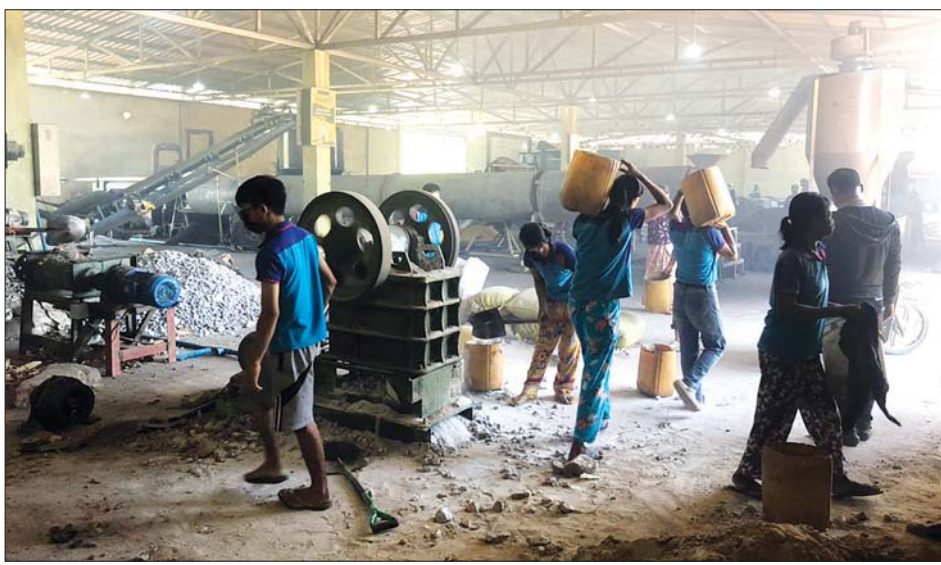
သဘာဝမြေဩဇာစက်ရုံအတွင်း အလုပ်လုပ်နေသည့် အလုပ်သမားများ။

စတင်တည်ဆောက်ခဲ့ပြီး လိုအပ်သောအခြောက်ခံ စက်အကြီး၊ အသေး၊ အမှုန်ရိုက်စက် နှစ်လုံး၊ မြေဆီ အလုံးထုတ်စက်နှင့် အတောင့်ထုတ်စက်များ၊ ကျောက်ခွဲစက်၊ အရိုးခွဲစက်၊ အိတ်ပိတ်စက်၊ နွားချေး အရည်အဖတ်ညှစ်စက်နှင့် စက်ထိုးဆန်ခါ စသည့်