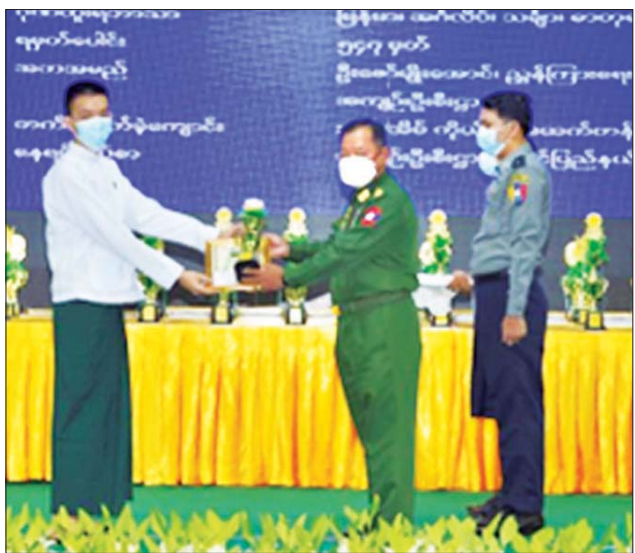
ပြည်ထောင်စုဝန်ကြီး ဒုတိယဗိုလ်ချုပ်ကြီး စိုးထွဋ် (၆)ဘာသာ ဂုဏ်ထူးရှင် ကျောင်းသားတစ်ဦးအား ဂုဏ်ပြုဆု ပေးအပ်ချီးမြှင့်စဉ်။

ထို့နောက် နိုင်ငံတော်စီမံအုပ်ချုပ်ရေးကောင်စီအဖွဲ့ဝင် ပြည်ထဲရေး ဝန်ကြီးဌာန၊ ပြည်ထောင်စုဝန်ကြီး ဒုတိယဗိုလ်ချုပ်ကြီး စိုးထွဋ်က အဖွင့်အမှာစကားပြောကြားပြီး ပြည်ထောင်စုဝန်ကြီးရုံးအပါအဝင်