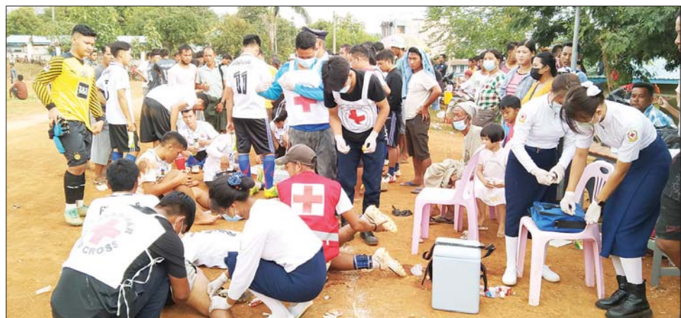
ကြက်ခြေနီတပ်ဖွဲ့ဝင်များက အားကစားသမားများအား ကျန်းမာရေးပြုစုပေးပေးစဉ်။