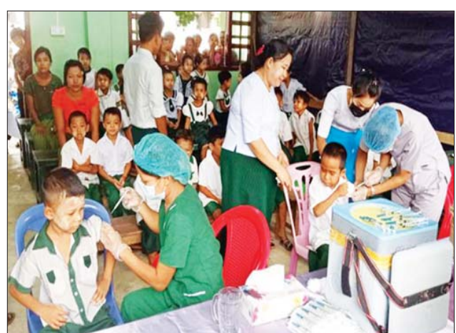
ကျောက်တော်မြို့နယ်၌ ကျောင်းသား ကျောင်းသူများအား ကိုဗစ်-၁၉ ကာကွယ်ဆေးထိုးနှံပေးစဉ်။

ထို့အတူ ကျောင်းသား ကျောင်းသူများကိုလည်း ကိုဗစ်-၁၉ ရောဂါ ကာကွယ်ဆေးထိုးနှံပေးလျက်ရှိရာ ယနေ့တွင် ဧရာဝတီတိုင်း