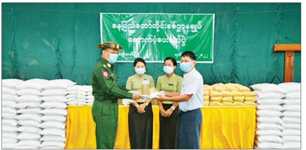
တစ်စုလျှင် ဆန်ရှစ်ပြည်၊ ဆီတစ်ပိဿာ၊ ဆား တစ်အိမ်ထောင်စုလျှင် ကျပ် ၆၀၀၀ နှုန်းဖြင့်လည်း တစ်ပိဿာနှင့် ကုလားပဲတစ်ပိဿာနှုန်းဖြင့်လည်း ကောင်း ထောက်ပံ့ပေးအပ်ခဲ့ခြင်းဖြစ်ကြောင်း ကောင်း၊ လူမှုဝန်ထမ်း၊ ကယ်ဆယ်ရေးနှင့် ပြန်လည် သတင်းရရှိသည်။

ညှိနှိုင်းဆောင်ရွက် ဦးစွာ တိုင်းမှူးနှင့် တာဝန်ရှိသူများက နေပြည်တော်ကောင်စီနယ်မြေ ဒက္ခိဏသီရိခရိုင်အတွင်း၌ လာရောက်တိမ်းရှောင်လာသူ အိမ်ထောင်စု ၁၁၅ စု အတွက် ဆန်၊ ဆီ၊ ကုလားပဲများနှင့် ထောက်ပံ့ငွေများကို ပေးအပ်ရာ (ယာပုံ) လာရောက်တိမ်းရှောင်သူ တစ်ဦးက ကျေးဇူးတင်စကား ပြန်လည်ပြောကြားသည်။ ထို့နောက် တိုင်းမှူးနှင့် တာဝန်ရှိသူများက လာရောက်တိမ်းရှောင်သူများအား ရင်းရင်းနှီးနှီး လိုက်လံနှုတ်ဆက်ပြီး လိုအပ်သည်များ ပေါင်းစပ် ညှိနှိုင်းဆောင်ရွက်ပေးသည်။ နေပြည်တော်ကောင်စီနယ်မြေအတွင်းသို့ ကချင်ပြည်နယ်၊ ကယားပြည်နယ်၊ ချင်းပြည်နယ်၊ ရှမ်းပြည်နယ်၊ မကွေးတိုင်းဒေသကြီးနှင့် စစ်ကိုင်းတိုင်းဒေသကြီးတို့မှ လာရောက်တိမ်းရှောင်သူ အိမ်ထောင်စု ၁၁၅ စုအတွက် တိုင်းစစ်ဌာနချုပ်မှ အိမ်ထောင်စု