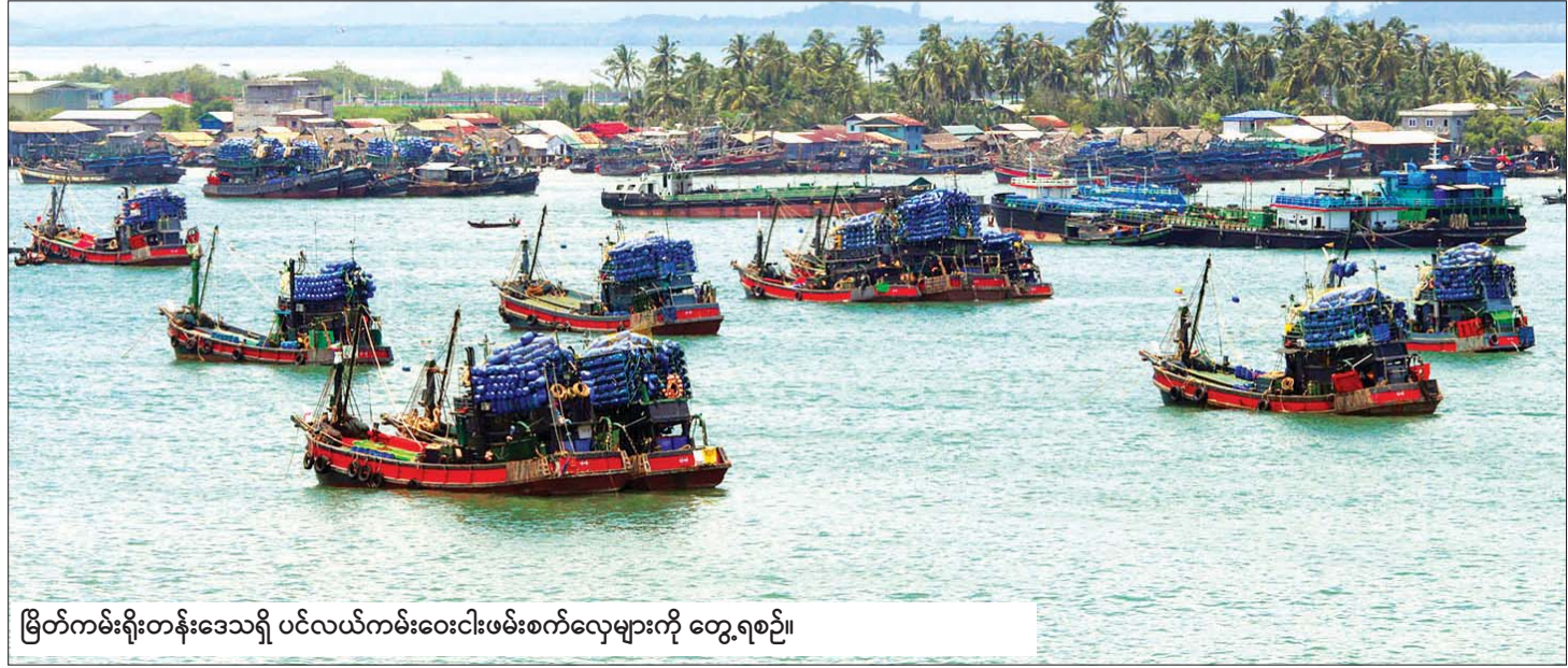
မြိတ်ကမ်းရိုးတန်းဒေသရှိ ပင်လယ်ကမ်းဝေးငါးဖမ်းစက်လှေများကို တွေ့ရစဉ်။

ငါးမွေးမြူရေးလုပ်ငန်းသည် ဝင်ငွေတိုးတက်ရရှိစေခြင်းဖြင့် ဆင်းရဲခြင်းနှင့် မညီမျှမှုတို့ကို လျော့ချရေး၊ အလုပ်အကိုင် အခွင့်အလမ်းကို တိုးပွားစေခြင်းနှင့် ရေရှည်ခိုင်ခံ့သော စီးပွားရေးဖွံ့ဖြိုးမှုကို အထောက်အပံ့ပြုစေခြင်းဖြင့် ရေရှည်ဖွံ့ဖြိုးမှု ပန်းတိုင်များကို ထိရောက်စွာပံ့ပိုးပေးနိုင်ခြင်း၊ လူတိုင်းအလွယ်တကူ စားသုံးနိုင်သော ငါးများကို ထုတ်လုပ်ပေးခြင်းဖြင့် စားနပ်ရိက္ခာတိုးပွားစေပြီး ငတ်မွတ်ခြင်းကို အဆုံးသတ်စေနိုင်ခြင်း၊ ငါးမွေးမြူရေးလုပ်ငန်းတွင် ထုတ်လုပ်ရေးနှင့် တန်ဖိုးကွင်းဆက်များ အဆက်မပြတ် ဖန်တီးပြုလုပ်ပေးခြင်းဖြင့် အမျိုးသမီးများ၏ အလုပ်အကိုင် အခွင့်အလမ်းများ ဖော်ထုတ်ပေးခြင်းနှင့် ငါး ပိုမိုစားသုံးခြင်းဖြင့် ကျန်းမာရေးကောင်းမွန်စေပြီး လူမှုဘဝကို တိုးတက်စေခြင်းစသည့် အကျိုးရလဒ်များကို ရရှိစေလျက်ရှိသည်။ ။