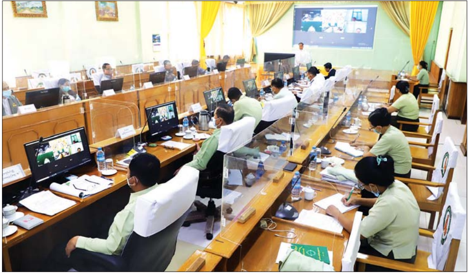
ထိန်းချုပ်ရေးလုပ်ငန်းများဆောင်ရွက်နေမှု အခြေအနေများကို ရှင်းလင်းတင်ပြသည်။ ထို့နောက် တိုင်းဒေသကြီး ဝန်ကြီးချုပ်က တိုင်းဒေသကြီးအတွင်း ဒေသတည်ငြိမ်အေးချမ်းရေးနှင့် အကောင်အထည်ဖော်ဆောင်ရွက်နေသည့် လုပ်ငန်းများအောင်မြင်ရေးအတွက် လိုအပ်သည်များကို တာဝန်ရှိသူများနှင့် ဖြည့်ဆည်းပေါင်းစပ်ဆောင်ရွက်ပေး၍ နိဂုံးချုပ်အမှာစကား ပြောကြားသည်။ တိုင်းဒေသကြီး (ပြန်/ဆက်)

ရှိ လမ်းပန်းဆက်သွယ်မှု လမ်းကြောင်းများတွင် အမြဲလိုမြဲစွာ သွားလာနိုင်ရေးအတွက် လုံခြုံရေးတာဝန်ရှိသူများက ဆောင်ရွက်ကြရန် အမှာစကားပြောကြားသည်။ (ယာပုံ) တိုင်းဒေသကြီးအတွင်းရှိ ကလေးခရိုင်၊ စစ်ကိုင်းခရိုင်၊ ရွှေဘိုခရိုင်၊ ခန္တီးခရိုင်များမှ စီမံအုပ်ချုပ်ရေးအဖွဲ့၊ ဥက္ကဋ္ဌများနှင့် နာဂကိုယ်ပိုင်အုပ်ချုပ်ခွင့်ရဒေသဦးစီးအဖွဲ့၊ ဥက္ကဋ္ဌတို့က Video Conferencing စနစ်ဖြင့် ခရိုင်/မြို့နယ်များ၌ ဒေသတည်ငြိမ်အေးချမ်းရေးအကောင်အထည်ဖော် ဆောင်ရွက်နေသည့်လုပ်ငန်းများ ဆောင်ရွက်နေမှုအခြေအနေများကို ရှင်းလင်းတင်ပြကာ တိုင်းဒေသကြီး လမ်းပန်းဆက်သွယ်ရေးဝန်ကြီး ရဲမှူးကြီးညွှန်ကြားမှုဌာနချုပ်က တိုင်းဒေသကြီးအတွင်း ဒေသတည်ငြိမ်အေးချမ်းရေး ဆောင်ရွက်နေမှုအခြေအနေများ၊ တိုင်းဒေသကြီး လုံခြုံရေးနှင့် နယ်စပ်ရေးရာဝန်ကြီး ဝင်းတင်စိုးက ခရိုင်/မြို့နယ်များတွင် ကိုဗစ်-၁၉ ရောဂါ ကာကွယ်၊ ကုသ