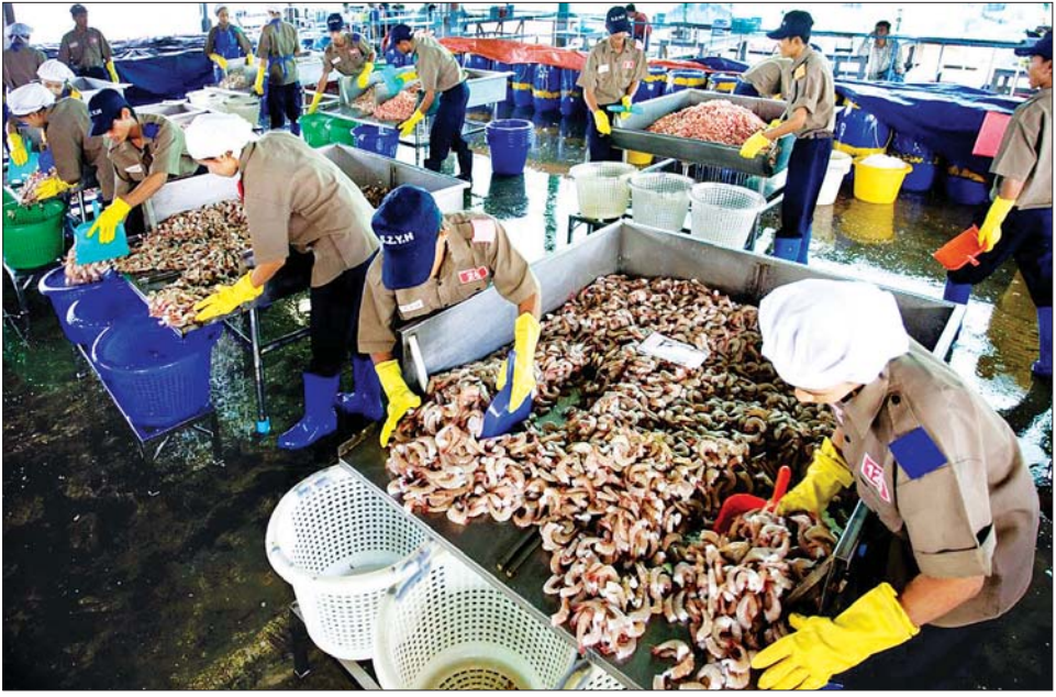
မြိတ်ခရိုင်အတွင်းမှ ငါး၊ ပုစွန်ထုတ်လုပ်ရေးလုပ်ငန်းတစ်ခု။

ရေလုပ်ငန်းကဏ္ဍမှ နိုင်ငံတော် အသားတင်ထုတ်လုပ်မှုတန်ဖိုး (GDP) တိုးတက်ရေးအတွက် ရေချို၊ ရေငန် ငါး၊ ပုစွန်များနှင့် အခြား ရေထွက်ကုန်ပစ္စည်းများ ထုတ်လုပ်ရာတွင် အစားအစာ ဘေးကင်းလုံခြုံရေးနှင့် တန်ဖိုးမြှင့်ထုတ်ကုန်များကို ပိုမိုထုတ်လုပ်နိုင်ရေးအတွက် နည်းပညာများ ပံ့ပိုးကူညီမှုနှင့် ပြည်တွင်း စားသုံးမှု ဖူလုံရေးအပြင် ပြည်ပတင်ပို့မှု တိုးမြှင့်နိုင်ရေးအတွက် ငါးလုပ်ငန်းဦးစီးဌာနက ရေထွက်ကုန်ပစ္စည်းများ တစ်နှစ်ထက်တစ်နှစ် တိုးတက်ထုတ်လုပ်နိုင်ရေး ဆောင်ရွက်လျက်ရှိသည်။ မြန်မာနိုင်ငံ၏ ငါးကဏ္ဍ ထုတ်လုပ်မှုအနေဖြင့် ၂၀၁၉-၂၀၂၀ ဘဏ္ဍာနှစ်စာရင်းများအရ မက်ထရစ်တန် ၆၀၁၈ တန် ထုတ်လုပ်နိုင်ခဲ့ပြီး ဖမ်းဆီးရေးမှ မက်ထရစ်တန် ၄၈၀၀ ကျော်နှင့် မွေးမြူရေးမှ မက်ထရစ်တန် ၁၁၀၀ ကျော် ထုတ်လုပ်နိုင်ခဲ့သဖြင့် အဆိုပါ ဘဏ္ဍာနှစ်တွင် ရေလုပ်ငန်းကဏ္ဍမှ ပြည်ပပို့ကုန်တန်ဖိုး အမေရိကန်ဒေါ်လာ ၈၅၈ ဒသမ ၉၆ သန်းကျော်ရှိခဲ့ရာ ပြည်တွင်းအသားတင်ထုတ်လုပ်မှုနှင့် ဝန်ဆောင်မှုတန်ဖိုး (GDP) တွင် ငါးကဏ္ဍ ထုတ်လုပ်မှုအနေဖြင့် ၄ ဒသမ ၇ ရာခိုင်နှုန်းအထိ တိုးမြှင့်လာခဲ့သည်။ ထို့အတူ ၂၀၂၀-၂၀၂၁ ဘဏ္ဍာနှစ်တွင် ငါးလုပ်ငန်းမှ နိုင်ငံတော်အတွက် အခွန်ငွေကျပ်ခြောက်ဘီလီယံ (သန်း ၆၀၀၀) ကျော်ရှိခဲ့ပြီး ပြည်ပတင်ပို့မှုမှ နိုင်ငံခြားဝင်ငွေ အမေရိကန် ဒေါ်လာ ၇၈၅ သန်းကျော် ရရှိခဲ့သည့်အတွက် ငါးလုပ်ငန်းဖြင့် နေ့စဉ် ပျမ်းမျှနိုင်ငံခြားဝင်ငွေ အမေရိကန် ဒေါ်လာ နှစ်သန်းကျော်ကို ရရှိလျက်ရှိကြောင်း သိရသည်။