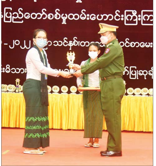
သင်နှစ်နှင့် ၂၀၂၁ - ၂၀၂၂ ပညာ ကျောင်းသား ကျောင်းသူများကို သင်နှစ် တက္ကသိုလ်ဝင်စာမေးပွဲ ဂုဏ်ပြုဆုများ ချီးမြှင့်ကြသည်။ သတင်းစဉ်