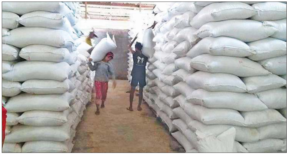
ဆန်စပါးကုန်သည်များအသင်း ဝါးတန်းဒိုင်မှ ဆန်အိတ်များ။

အားများလို့လည်း မဟုတ်ဘူး။ ရောင်းလိုအားကြောင့် လည်း မဟုတ်ဘူး။ လမ်းပန်းဆက်သွယ်ရေးမှာ ဒီဇယ်ဈေးလေးတက်သွားတယ်။ အရင်က စပါး တစ်ရာကို သယ်ယူခ သုံးလေးသောင်းပေးရရင် အခုက ရှစ်သောင်း၊ ကိုးသောင်းပေးရတယ်။ မြေဆီ