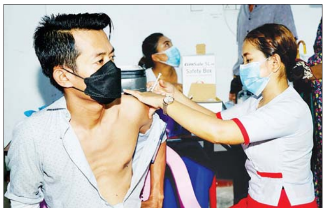
မောင်တောမြို့နယ်၌ ကိုဗစ်-၁၉ ရောဂါကာကွယ်ဆေး ဆက်လက်ထိုးနှံပေး