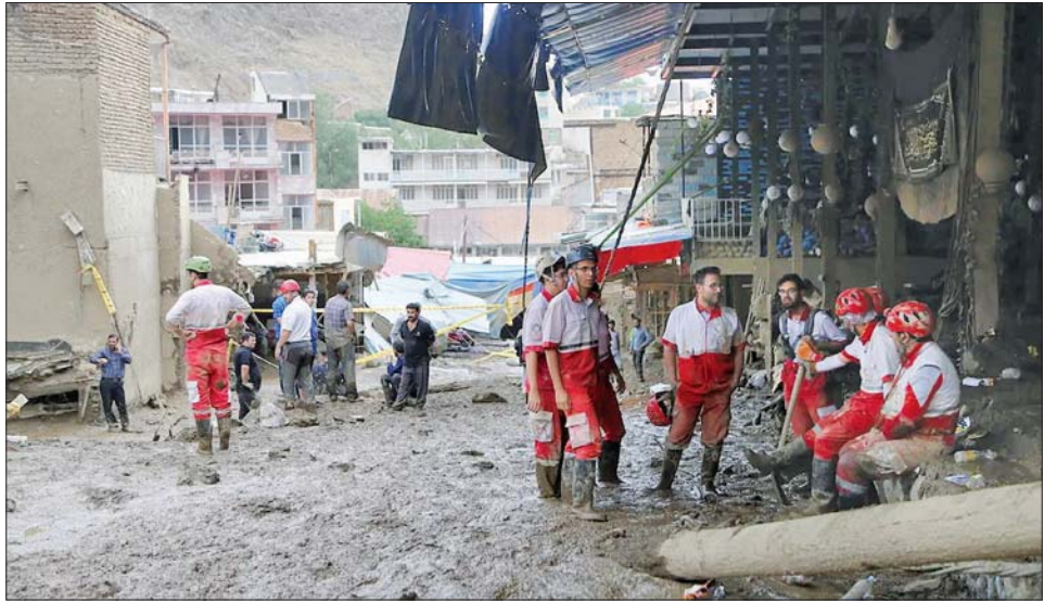
တီဟီရန်မြို့ အီမန်ဇာဒက် ဒါဗုဒ်ဒေသတွင် မိုးသည်းထန်စွာရွာသွန်းပြီးနောက် ရှာဖွေရေးနှင့် ကယ်ဆယ်ရေး လုပ်ငန်းများက ကယ်ဆယ်ရေးလုပ်ငန်းများ ဆောင်ရွက်နေမှုကို တွေ့ရစဉ်။