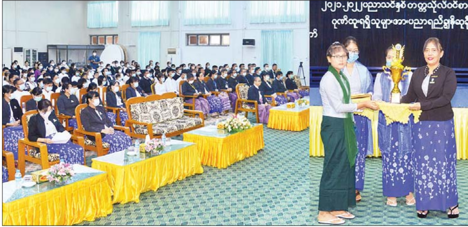
ကိုယ်ကျင့်တရားများဖြင့် နေထိုင်တတ်ကြရန်လိုအပ်ကြောင်း၊ မိမိတို့၏ မိသားစုဂုဏ်၊ ကျောင်း၏ဂုဏ်ကို ဆောင်နိုင်ခြင်းမှသည် နိုင်ငံတော်၏ ဂုဏ်ကိုပါ ထွန်းလင်းစေအောင် ကြိုးစားသွားကြစေလိုကြောင်း ပြောကြားသည်။ ထို့နောက် ပြည်ထောင်စုဝန်ကြီးက ၂၀၂၁-၂၀၂၂

၂၀၂၁-၂၀၂၂ ပညာသင်နှစ်တွင် တက္ကသိုလ်ဝင်စာမေးပွဲ ထူးချွန်စွာအောင်မြင်ခဲ့သည့် ဥပဒေရေးရာဝန်ကြီးဌာနမှ ဝန်ထမ်းများ၏ သားသမီးများအား ဂုဏ်ပြုချီးမြှင့်ခြင်းနှင့် ၂၀၂၂-၂၀၂၃ ပညာသင်နှစ်အတွက် ပညာသင်စရိတ် ထောက်ပံ့ချီးမြှင့်ခြင်း အခမ်းအနားကို ယနေ့ နံနက်ပိုင်းတွင် ဝန်ကြီးဌာန၏ မြေညီထပ်အစည်းအဝေးခန်းမ၌ ကျင်းပသည်။