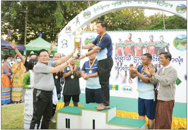
ရှေးဦးစွာ ဒုတိယဝန်ကြီး ဒေါက်တာအောင်ကြီးနှင့် ပရိသတ်များက စိုက်ပျိုးရေးဦးစီးဌာနအသင်းနှင့် ဆည်မြောင်းနှင့် ရေအသုံးချမှု စီမံခန့်ခွဲရေးဦးစီးဌာနအသင်းတို့၏ ဗိုလ်လုပွဲ ယှဉ်ပြိုင်ကစားနေမှုကို ကြည့်ရှုအားပေးသည်။ ထို့နောက် ဆုချီးမြှင့်ပွဲကို ကျင်းပရာ ညွှန်ကြားရေးမှူးချုပ်

စိုက်ပျိုးရေး၊ မွေးမြူရေးနှင့် ဆည်မြောင်းဝန်ကြီးဌာန မိုးရာသီဌာနပေါင်းစုံ အမျိုးသားဘောလုံးအားကစားပြိုင်ပွဲ ဆုပေးပွဲကို ယမန်နေ့ ညနေပိုင်းက နေပြည်တော်ဇေယျာသီရိမြို့နယ်ရေဆင်း ရှိစိုက်ပျိုးရေးသုတေသနဦးစီးဌာနဘောလုံးအားကစားကွင်း၌ ကျင်းပရာ ဒုတိယဝန်ကြီး ဒေါက်တာအောင်ကြီး၊ ညွှန်ကြားရေးမှူးချုပ်များ၊ ပါမောက္ခချုပ်များနှင့် ဝန်ထမ်းများ၊ ဦးစီးဌာနများနှင့် တက္ကသိုလ်ကိုယ်စားပြု ဘောလုံးအားကစားသမား နိုင်ငံ့ဝန်ထမ်းများ တက်ရောက်ကြသည်။