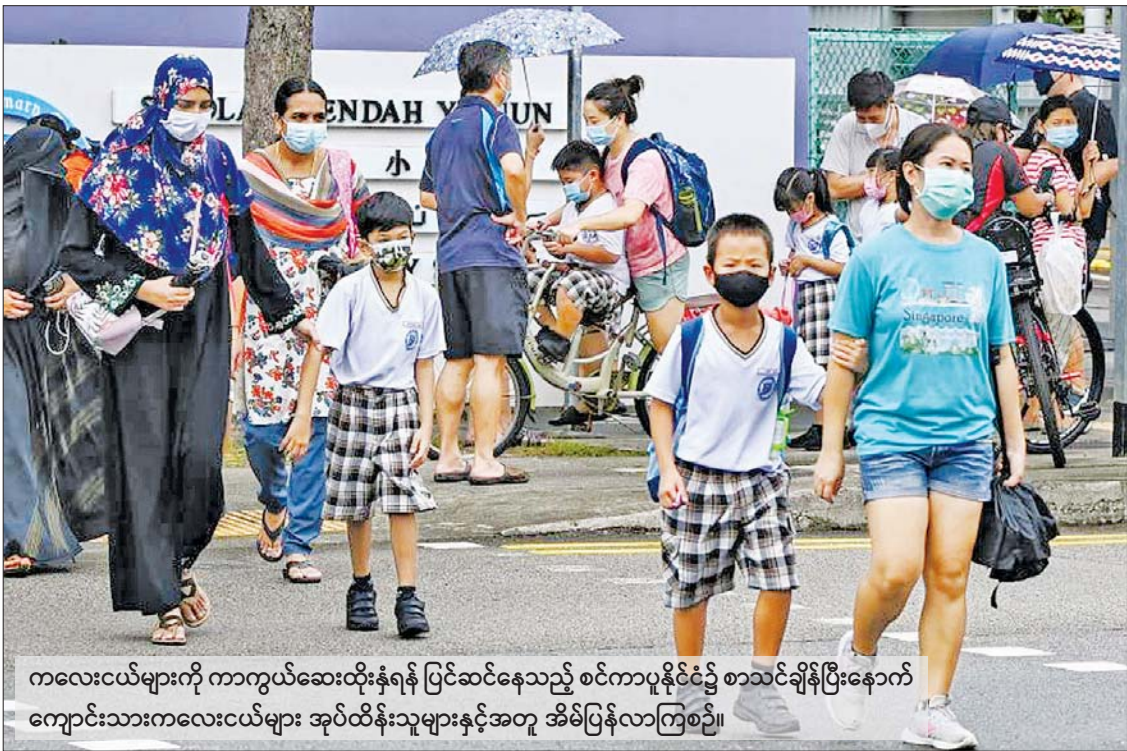
ကလေးငယ်များကို ကာကွယ်ဆေးထိုးနှံရန် ပြင်ဆင်နေသည့် စင်ကာပူနိုင်ငံ၌ စာသင်ချိန်ပြီးနောက် ကျောင်းသားကလေးငယ်များ အုပ်ထိန်းသူများနှင့်အတူ အိမ်ပြန်လာကြစဉ်။

သမ္မတဘိုင်ဒင် ကိုဗစ်ကူးစက် ကိုဗစ်-၁၉ ကာကွယ်ဆေးနဲ့ ပတ်သက်ပြီး ကမ္ဘာတစ်ဝန်းထုတ်လုပ်မှုတွေ၊ ထိုးနှံမှုတွေ အင်တိုက်အားတိုက်နဲ့ ကျယ်ကျယ်ပြန့်ပြန့် ပြုလုပ်နေပေမယ့်လည်း မျိုးရိုးဗီဇပြောင်းမိုင်းရပ်စ် အိုမီခရုန်မျိုးကွဲတွေကြောင့် ကာကွယ်ဆေးထိုးနှံမှုအခါခါ ထပ်ဆောင်း ကာကွယ်ဆေးထိုးနှံမှု အထပ်ထပ်ထိုးနှံထားသော်လည်း ကူးစက်မှုတွေ၊ သေဆုံးမှုတွေကတော့ ယခင်ကထက် လျော့နည်းပေမယ့် ဆက်လက်ရှိနေဆဲပါ။ မကြာသေးခင်ကပဲ အမေရိကန်သမ္မတ ဂျိုးဘိုင်ဒင် ကိုဗစ်-၁၉ ရောဂါ ကူးစက်ခံထားရတယ်ဆိုတဲ့သတင်း နိုင်ငံတကာ သတင်းရင်းမြစ်တွေမှာ အကျယ်တဝင့် ဖော်ပြထားတာ တွေ့ရတယ်။ တချို့ သတင်းတွေမှာ သမ္မတ ဘိုင်ဒင်အနေနဲ့ ကိုဗစ်ကာကွယ်ဆေး လေးကြိမ်လောက် အထိ ထိုးနှံထားတယ်လို့တောင် ဖော်ပြထားတာ တွေ့ရတယ်။ ဒါပေမယ့်လည်း မကြာသေးခင် ရက်ပိုင်းက သတင်းတွေအရ သမ္မတဘိုင်ဒင်အနေနဲ့ ဆေးကုသမှု ငါးရက်လောက်ခံယူအပြီးမှာ ပြန်လည်ကောင်းမွန်လာပြီး အိမ်ဖြူတော်မှာ ပထမဆုံးလူကုန်တိုင် မိန့်ခွန်းပြောကြားခဲ့တယ်လို့ သိရပါတယ်။ မည်သို့ပင် ကိုဗစ်-၁၉ ကာကွယ်ဆေး ထိုးနှံထားကောမူ ရောဂါဖြစ်ပွားမှုဟာ ကမ္ဘာတစ်ဝန်းမှာ ဆက်လက်ကူးစက်ဖြစ်ပွားနေဆဲပါ။ တချို့နိုင်ငံတွေမှာ ကိုဗစ်-၁၉ ရောဂါဖြစ်ပွားမှု ပထမလှိုင်း၊ ဒုတိယလှိုင်း၊ တတိယလှိုင်း၊ စတုတ္ထလှိုင်း၊ ပဉ္စမလှိုင်းနဲ့ ဆဋ္ဌမလှိုင်း အထိ ကျော်ဖြတ်ပြီး ဖြစ်ပါတယ်။ ဂျပန်နိုင်ငံဆိုရင် ကိုဗစ်-၁၉ သတ္တမလှိုင်းနဲ့ ရင်ဆိုင်နေရပြီလို့ မကြာသေးမီက ထုတ်ပြန်ကြေညာထားတာ တွေ့ရတယ်။ ဒါပေမယ့်လည်း ကာကွယ်ဆေး ထိုးနှံထားတဲ့သူတွေဟာ ကာကွယ်ဆေးမထိုးနှံထားတဲ့ သူတွေထက် ရောဂါ ပြင်းထန်မှုနဲ့ သေဆုံးနိုင်ခြေ နည်းပါးတယ်လို့ သတင်းရင်းမြစ်တွေမှာ ဖော်ပြထားပါတယ်။ အဲဒီလို လှိုင်းအထပ်ထပ်နဲ့ ကူးစက်မှုကြား၊ သေဆုံးမှုကြားမှာ လူသား