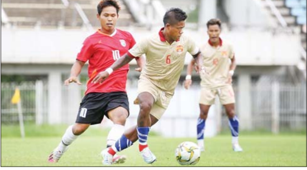
GFA အသင်းနှင့် ဧရာဝတီအသင်း ယှဉ်ပြိုင်နေစဉ်။

ရန်ကုန် ဇူလိုင် ၃၀ ၂၀၂၂ ရာသီ MNL အမှတ်ပေးပြိုင်ပွဲ ပွဲစဉ် (၆) ပထမနေ့အဖြစ် GFA အသင်းနှင့် ဧရာဝတီအသင်းတို့ ဇူလိုင် ၃၀ ရက်က သုဝဏ္ဏကွင်း၌ ယှဉ်ပြိုင်ကစားရာ ဧရာဝတီအသင်းက လေးဂိုး-နှစ်ဂိုးဖြင့် အနိုင်ရရှိ ခဲ့သည်။ စာမျက်နှာ ၁၂ ကော်လံ ၅