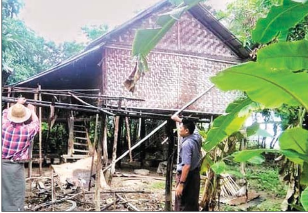
ငွေကျပ် ကိုးသိန်းနှင့် ရေဘေးသင့်ပြည်သူတစ်ဦးလျှင် ဆန်ရိက္ခာဖိုး ငွေကျပ် ၂၀၀၀ နှုန်းဖြင့် လူဦးရေ ၃၁ ဦးတို့အတွက် ငွေကျပ် ၆၅၁၀၀ ကို ထောက်ပံ့ပေးအပ်ခဲ့ကြောင်း ခရိုင်ဘေးအန္တရာယ်ဆိုင်ရာစီမံခန့်ခွဲမှုဦးစီးဌာနထံက သိရသည်။

ထိုသို့ ပြောင်းရွှေ့နေထိုင်နိုင်ရေးအတွက် သက်ဆိုင်ရာဌာနဆိုင်ရာ တာဝန်ရှိသူများနှင့် ဒေသခံလူမှုရေးအဖွဲ့အစည်းများ စုပေါင်း၍ ဘေးလွတ်ရာ မြေနေရာအသီးသီးများသို့ ကူညီပြောင်းဆောင်ရွက်ပေးခဲ့ကြပြီး ပြောင်းရွှေ့နေထိုင်ကြသည့် အိမ်ထောင်စုကိုးစုအတွက်