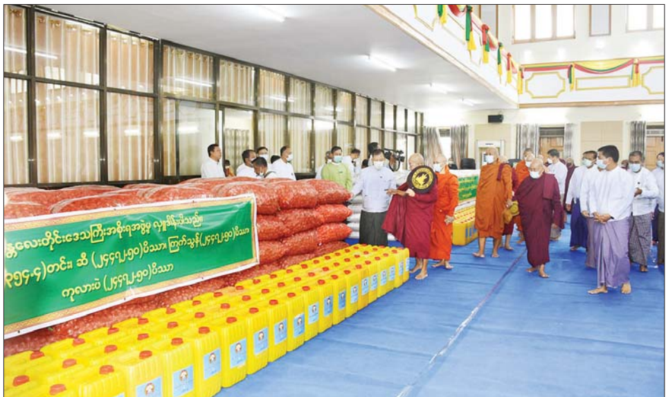
ရပ်သိမ်း၍ နေဆွမ်းဆက်ကပ်လှူဒါန်းသည်။ ယနေ့ပြုလုပ်သောလှူဒါန်းမှု၌ မန္တလေးမြို့နယ် ခုနစ်မြို့နယ်ဖြစ်သော အောင်မြေသာစံ၊ ချမ်းအေးသာစံ၊ မဟာအောင်မြေ၊ ချမ်းမြသာစည်၊ ပြည်ကြီးတံခွန်၊ ပုသိမ်ကြီး၊ အမရပူရ တို့တွင် ဝါဆို ရဟန်း၊ သာမဏေ ၄၃၅၅၅ ပါးနှင့် သီလရှင် အပါး ၅၃၈၀ စုစုပေါင်း ၄၈၉၄၅ ပါးတို့အတွက် ဆန် ၁၈၃၅၄ တင်း၊ ဆီ ၂၄၄၇၂ ပိဿာ၊ ကြက်သွန်နီ ၂၄၄၇၂ ပိဿာ၊ ကုလားပဲ ၂၄၄၇၂ ပိဿာ (စုစုပေါင်းတန်ဖိုး ငွေကျပ် ၇၂၅၅၄၉၀၀၀)တို့ကို ဆက်ကပ်လှူဒါန်းခဲ့ကြောင်း သိရသည်။ သတင်းစဉ်