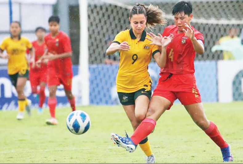
မြန်မာနှင့် ဩစတြေးလျအသင်း ယှဉ်ပြိုင်နေစဉ်။