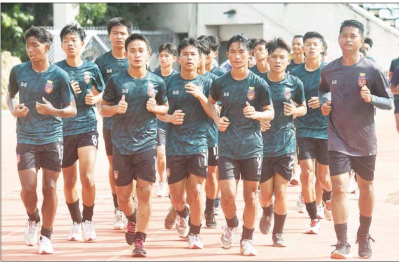
မြန်မာ ယူ-၁၆ အသင်း ပြိုင်ပွဲမတိုင်မီ လေ့ကျင့်နေစဉ်။

နေပြည်တော် ဇူလိုင် ၂၉ နယ်စပ်ဒေသအသီးသီးနှင့် အချို့သောတိုင်းရင်းသားလက်နက်ကိုင်အဖွဲ့များအတွင်းသို့ ရောက်ရှိနေ သည့် CDM ဝန်ထမ်းများ၊ ကျောင်းသား၊ ကျောင်းသူများနှင့် လူငယ်၊ လူရွယ်များအား နယ်စပ်ကြိုဆိုရေး စခန်းအသီးသီးနှင့် နီးစပ်ရာတပ်မတော်၊ မြန်မာနိုင်ငံရဲတပ်ဖွဲ့စခန်းအသီးသီးသို့ ဆက်သွယ်၍ ဥပဒေဘောင်အတွင်း ပြန်လည်ဝင်ရောက်နိုင်ကြောင်းနှင့် ယင်းသို့သတင်းပို့ဆက်သွယ်သူများကို သတ်မှတ်စည်းကမ်းချက်များနှင့်အညီ နေ့စဉ်ပြည်သူ့ဘဝတွင် အေးချမ်းစွာနေထိုင်နိုင်ရေး အာမခံချက် ပေးသွားမည်ဖြစ်ကြောင်း နိုင်ငံတော်စီမံအုပ်ချုပ်ရေးကောင်စီ သတင်းထုတ်ပြန်ရေးအဖွဲ့က အသိပေး ထုတ်ပြန်ထားရှိပြီး ဖြစ်ပါသည်။ စာမျက်နှာ ၁၂ ကော်လံ ၁ □