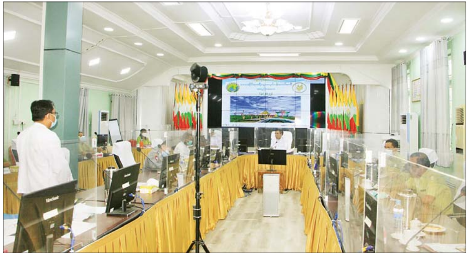
တိုးခြင်းနှင့် ကမ္ဘာ့ခရီးသွားလုပ်ငန်းနေ့တွင် ချက်များနှင့်ပတ်သက်၍ အကြံပြုဆွေးနွေး နေပြည်တော်ပြခန်း၌ ခင်းကျင်းပြသသွားမည့် တင်ပြကြရာ တိုင်းဒေသကြီးဝန်ကြီးချုပ်က ဥပဒေ၊ နမူနာပုံစံများကို ရှင်းလင်းတင်ပြသည်။ နည်းဥပဒေနှင့်အညီ ဆောင်ရွက်ပေးခဲ့ကြောင်း သိရသည်။ ယင်းနောက် ကော်မတီအဖွဲ့ဝင်များက တင်ပြ သတင်းစဉ်

ဖြစ်သည်။ ဆက်လက်၍ တိုင်းဒေသကြီးဝန်ကြီးချုပ်က အစိုးရအဖွဲ့အနေဖြင့် ရှေးဟောင်းအဆောက်အအုံ၊ ကျေး မြို့ရိုးများ ပြန်လည်အဆင့်မြှင့်တင်၍ ခရီးသွားနေရာ သစ်များ ဖော်ထုတ်ခြင်း၊ ရှေးဟောင်းယဉ်ကျေးမှု ဆိုင်ရာ အပန်းဖြေနေရာများ တည်ဆောက်ခြင်းနှင့် အတူ မြို့ပြသန့်ရှင်းသာယာလှပစေရေးကို ကြိုးပမ်း ဆောင်ရွက်လျက်ရှိကြောင်း၊ ကော်မတီအနေဖြင့် ခရီးသွားဧည့်သည်များ၏ လုံခြုံရေး၊ ဘေးအန္တရာယ် ကင်းရှင်းရေးနှင့် ခရီးသွားလုပ်ငန်းများ စနစ်တကျ ဖွံ့ဖြိုးတိုးတက်ရေးတို့ကို ဆွေးနွေးအကြံပြုကြစေ လိုကြောင်း ပြောကြားသည်။ ထို့နောက် ဟိုတယ်နှင့် ခရီးသွားညွှန်ကြားမှုဦးစီး ဌာန တိုင်းဒေသကြီးဦးစီးမှူးက ဟိုတယ်လုပ်ငန်း လိုင်စင်အသစ်လျှောက်ထားလာမှုတစ်ခုခု ခရီးလှည့်လည် ရေးကုမ္ပဏီ သက်တမ်းတိုးတစ်ခု၊ လုပ်ငန်းလိုင်စင် သက်တမ်းတိုးခြင်း၊ ခရီးသွားဧည့်လမ်းညွှန်သက်တမ်း