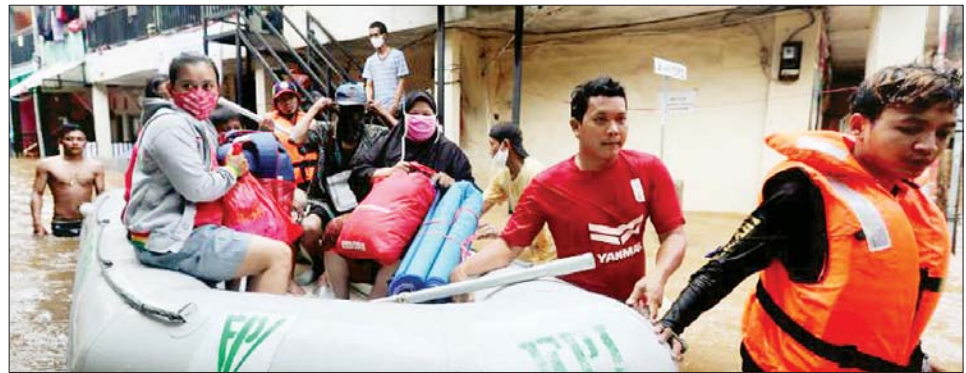
ရေစခန်းများသို့ သွားရောက်ခဲ့လှုံ့ခဲ့ရကြောင်း၊ ရေအတွက် ဖွင့်လှစ်ထားကြောင်း ၎င်းကဆက်လက် ကယ်ဆယ်ရေးစခန်းများနှင့် ထောက်ပံ့ပို့ဆောင်ရေး ပြောကြားသည်။ စခန်းများကို သဘာဝဘေးအန္တရာယ်ကူညီကယ်ဆယ် ဆင်ယွာ

အီဒရမ် အမ်တီ လိုပိက ပြောသည်။ မိမိတို့ရွာတွင် ဇူလိုင် ၂၈ ရက်ညက ရေများ ရုတ်တရက်ကြီးလာပြီး အိမ်များနှင့် အဆောက်အအုံများအားလုံး ရေလွှမ်းမိုးနှစ်မြုပ်ခဲ့ကြောင်း ၎င်းက ပြောသည်။ ရေဘေးသင့်ဒေသများအားလုံးကို စစ်ဆေးပြီး နောက် ရေကြီးနှစ်မြုပ်မှုကြောင့် လူသုံးဦးသေဆုံးကြောင်းနှင့် လေးဦးပျောက်ဆုံးနေကြောင်း၊ ပျောက်ဆုံးသူများကို ရှာဖွေကယ်ဆယ်ရေး အရာရှိများက ဆက်လက်ရှာဖွေလျက်ရှိကြောင်း ၎င်းက ပြောသည်။ အိမ်များအားလုံးပေါ်သို့ တစ်မီတာအထိ ရေလွှမ်းမိုးနှစ်မြုပ်ခဲ့သောကြောင့် ဒေသခံများသည် ကုန်းမြင့်များရှိ သဘာဝဘေးအန္တရာယ်ကာကွယ်