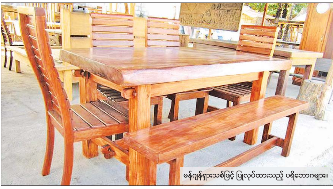
မန်ဂျန်ရှားသစ်ဖြင့် ပြုလုပ်ထားသည့် ပရိဘောဂများ။

မန်ဂျန်ရှားသစ်၏အရောင်မှာ ညိုဝါရောင်ရှိပါသည်။ အဆိုပါ မန်ဂျန်ရှားသစ်ကို အထပ်သား၊ တံခါးကျည်းပေါင်၊ ပါကေး၊ ပရိဘောဂ၊ စက်လှေနှင့်မော်တော်ယာဉ်များတွင်လည်း အသုံးပြုလျက်ရှိပါသည်။ သက်တမ်းနုသည့် မန်ဂျန်ရှားပင်များကို စက္ကူပြုစုဖတ် ပြုလုပ်ရာတွင် အသုံးပြုရာ၌ အရည်အသွေးကောင်းမွန်သည့် စက္ကူဖြူများကို ရရှိကြောင်း သိရသည်။ ထို့ကြောင့် ကျွန်းပင်သည် နှစ် ၃၀ ခန့်ရှိမှသာ သစ်အနေဖြင့် အသုံးပြုရန် ကောင်းမွန်ပြီး မန်ဂျန်ရှားပင်သည် ၁၀ နှစ်ဝန်းကျင်တွင် အသုံးပြုနိုင်သည့် သစ်အမျိုးအစားဖြစ်ကာ ကျွန်းတုခေါ် ကြီးမြန်သစ်ပင် မန်ဂျန်ရှားပင်သည် သဘာဝပတ်ဝန်းကျင် သာယာလှပရေး၊ လူမှုစီးပွားဘဝတွင် အဆင်ပြေနိုင်ရေး စိုက်ပျိုးရန် လွန်စွာ သင့်တော်သည့်အပင် ဖြစ်ပါကြောင်း။