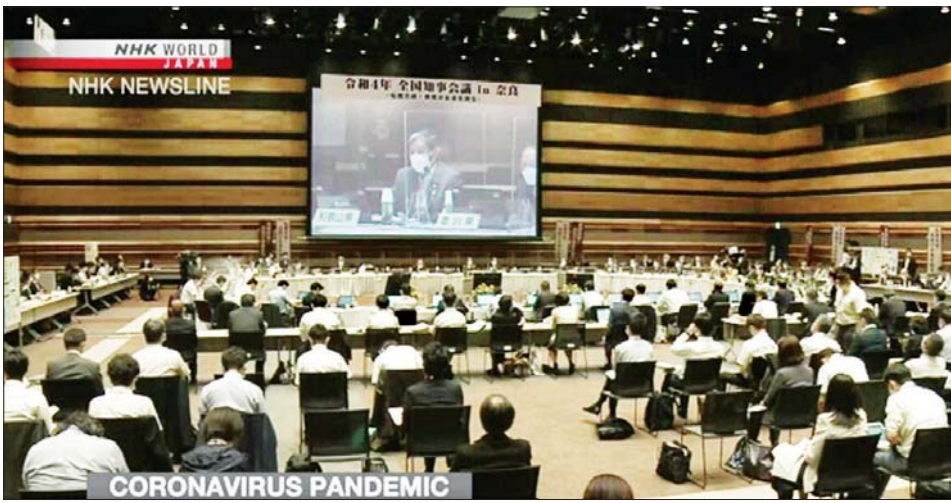
အိုမီခရွန်ဗီဇပြောင်း ကိုဗစ်-၁၉ မျိုးကွဲ BA.5 ကို ဆန့်ကျင်ကာကွယ်ရန် ဂျပန်အစိုးရက ခရိုင်အစိုးရများကို လုပ်ပိုင်ခွင့် ပိုမိုပေးအပ်သွားရန် ဆွေးနွေးနေစဉ်။

တိုကျို ဇူလိုင် ၂၉ ဂျပန်အစိုးရသည် အိုမီခရွန်ဗီဇပြောင်း ကိုဗစ်-၁၉ မျိုးကွဲ BA.5 ကို ကာကွယ်တိုက်ဖျက်ရန် ခရိုင်များကို လုပ်ပိုင်ခွင့်ပေးမည့် စနစ်တစ်ခု ဖန်တီးပေးရန် ဇူလိုင် ၂၉ ရက်က ဆုံးဖြတ်ခဲ့သည်။ ခရိုင်အစိုးရများကို ၎င်းတို့၏ ဆေးဘက်ဆိုင်ရာ အဆောက်အအုံများ၌ ဝန်ပိုလာသောအချိန်တွင် ကြေညာချက်ထုတ်ပြန်ရန် ခွင့်ပြုလိုက်ခြင်းဖြစ်သည်။ ကြေညာချက် ထုတ်ပြန်ပြီး နောက်ခရိုင်အစိုးရများက ဒေသခံများကို ကိုဗစ်-၁၉ ကာကွယ်ရေးဆောင်ရွက်ချက်များနှင့်အတူ ကိုဗစ်-၁၉ ကာကွယ်ဆေးထိုးမှုကို ဆောလျင်စွာခံယူရန် တိုက်တွန်း လိမ့်မည်ဖြစ်သလို အဝေးမှ အလုပ်လုပ်ရန် အခြေအနေများကို