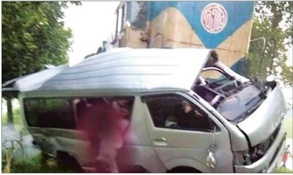
ရထားက မိနီဘတ်စ်ကို ဝင်ရောက်တိုက်မိစဉ်။

ပြေးဆွဲနေသော ယင်းရထားသည် ရထားလမ်းဖြတ်တစ်ခုတွင် ခရီးသည် မိနီဘတ်စ်ကားကို ဝင်ရောက်တိုက်မိခဲ့ခြင်းဖြစ်သည်။ မတော်တဆမှုကြောင့် ၁၁ ဦး သေဆုံးခဲ့ရာ သေဆုံးခဲ့သူများတွင် မိနီဘတ်စ်ကားမောင်းသမားလည်း ပါဝင်ခဲ့ကြောင်း ရဲအရာရှိက ဆက်လက်ပြောကြားသည်။ သေဆုံးသူများအားလုံးမှာ ချက်တိုဂရမ်ဒေသ မာရာရီရှိ ချိုင်းရာချိုရာ ရေတံခွန်သို့ လာရောက်သည့် ဧည့်သည်ခရီးသွားများ ဖြစ်ကြသည်။ မိနီဘတ်စ်သည် ရထားလာနေကြောင်း အချက်ပြမှုကို သတိမမူဘဲ ရထားလမ်းပေါ်သို့ တက်လာခဲ့သောကြောင့် ယခုလို မတော်တဆမှု ဖြစ်ပွားခဲ့ခြင်း ဖြစ်ကြောင်း ရထားအရာရှိတစ်ဦးက ပြောသည်။ ဆင်ယွာ