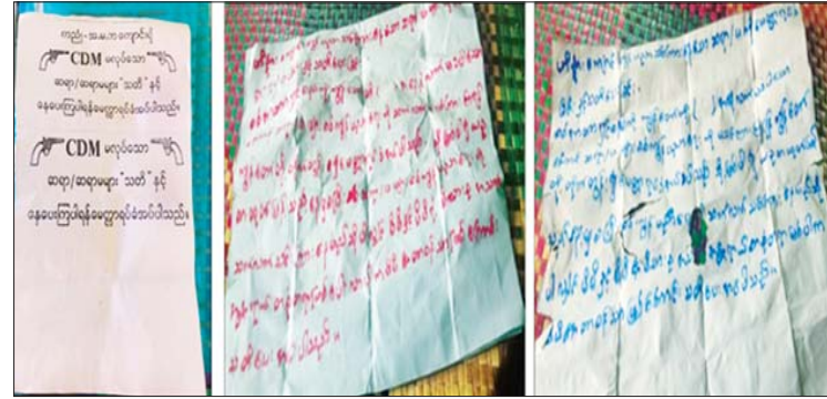
တနင်္သာရီတိုင်းဒေသကြီး ထားဝယ်မြို့နယ်၌ ခြိမ်းခြောက်စာများ တွေ့ရှိမှု။

နေပြည်တော် ဇူလိုင် ၂၉ NUG အမည်ခံအကြမ်းဖက်အဖွဲ့နှင့် ၎င်း၏ လက်အောက်ခံ PDF အမည်ခံ အကြမ်းဖက်သမားများသည် အနာဂတ် ရင်သွေးငယ်များ၏ ပညာသင်ကြား သင်ယူခွင့် အခွင့်အလမ်းများ ပျက်ပြား၍ ပညာမဲ့လူတန်းစားများ ဖြစ်ပေါ်လာစေ ရန်နှင့် ၎င်းတို့ကို အကြောက်တရားဖြင့် ထောက်ခံအားပေးလာစေရန် ယုတ်မာ ရိုင်းစိုင်းသော ရည်ရွယ်ချက်များဖြင့် စာမျက်နှာ ၁၄ ကော်လံ ၁ ❖