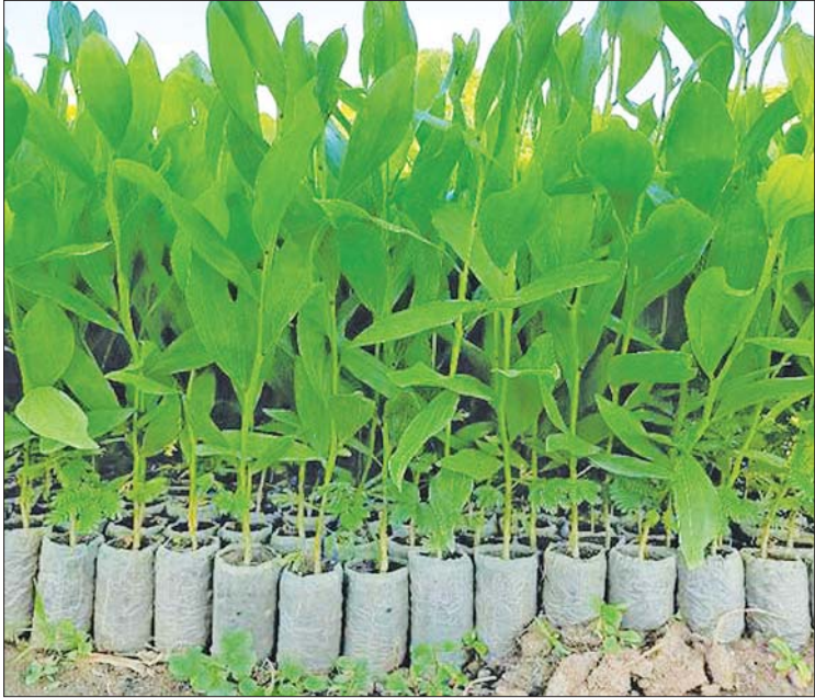
မန်ဂျန်ရှားပျိုးပင်များ။

ယနေ့ကမ္ဘာကြီးသည် သဘာဝပတ်ဝန်းကျင် ပျက်စီးမှုများနှင့် အကြီးအကျယ် ရင်ဆိုင်နေကြရသည်။ သဘာဝပတ်ဝန်းကျင်ကို ကာကွယ်သည့်အနေဖြင့် လည်းကောင်း၊ မိမိခြံအတွင်း အရိပ်ရစေလို၍လည်းကောင်း၊ စီးပွားဖြစ် ရင်းနှီးမြှုပ်နှံလို၍လည်းကောင်း၊ သစ်တောစိုက်ခင်းတည်ထောင်လိုပြီး သစ်အစားထိုးစိုက်ပျိုးကာ အချိန်တိုအတွင်း အကျိုးအမြတ်ဖြစ်ထွန်းလိုလျှင် လည်းကောင်း စိုက်ပျိုးသင့်သည့် သစ်အမျိုးအစားမှာ ဒေသအခေါ် မန်ဂျန်ရှား (Acacia mangium) ဖြစ်ပါသည်။