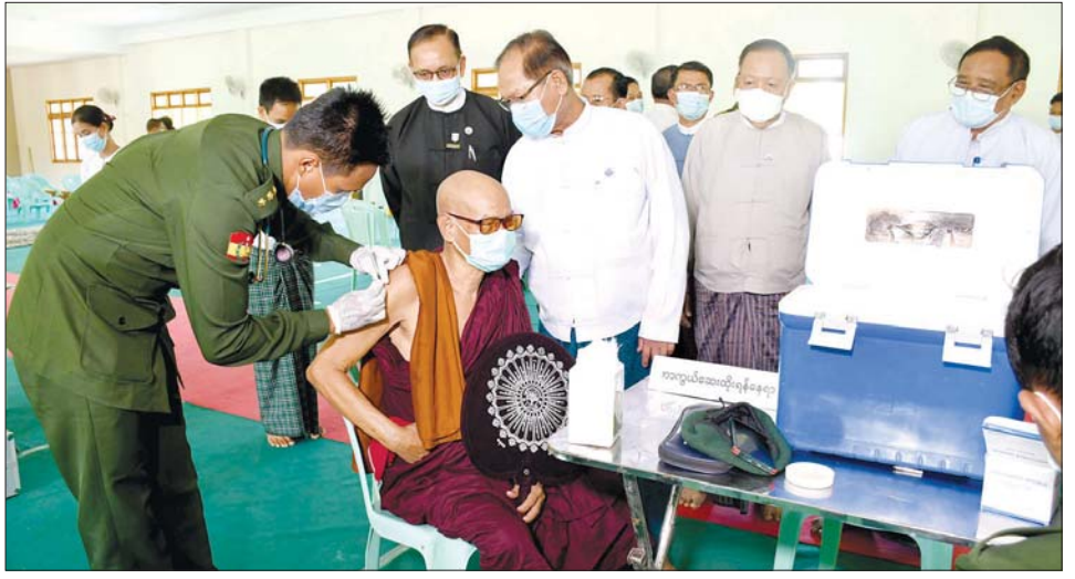
ပြန်ခွင့်ပြုကြောင်း၊ ကာကွယ်ဆေးထိုးနှံရာတွင် ထပ်ဆောင်းထိုးနှံပေးခြင်းအပြင် အကြောင်းအမျိုး မျိုးကြောင့် ယခင်က ကာကွယ်ဆေးမထိုးနှံရသေး သည့် ရဟန်း၊ သာမဏေနှင့် သီလရှင်များကိုလည်း ထိုးနှံပေးလျက်ရှိကြောင်း သိရသည်။ တင်ထွန်း(ပြန်/ဆက်)

ကိုဗစ်-၁၉ ကာကွယ်ဆေး ထပ်ဆောင်းထိုးနှံ ပေးရာတွင် ဆေးထိုးနှံခြင်းမပြုမီ စစ်တွေတပ်နယ်မှ ဆေးဝန်ထမ်းများ၊ ကျန်းမာရေးဝန်ထမ်းများနှင့် အထွေထွေအုပ်ချုပ်ရေးဦးစီးဌာနမှ ဝန်ထမ်းများက စာရင်းကောက်ယူခြင်း၊ ကိုယ်အပူချိန်တိုင်းတာပေး ခြင်း၊ သွေးပေါင်ချိန်တိုင်းတာပေးခြင်း၊ သွေးအတွင်း အောက်ဆီဂျင်ပါဝင်မှုမာဏ တိုင်းတာပေးခြင်း တို့ကိုဆောင်ရွက်ပေးကြပြီး ပုံမှန်အနေအထားရှိမှသာ ကာကွယ်ဆေးထိုးနှံပေးခြင်းဖြစ်ကာ ဆေးထိုးနှံပြီး နောက်တွင်လည်း မိနစ် ၃၀ အကြာစောင့်ကြည့်ပြီးမှ