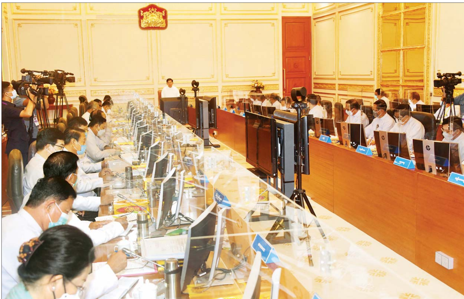
နိုင်ငံတော်စီမံအုပ်ချုပ်ရေးကောင်စီဥက္ကဋ္ဌ နိုင်ငံတော်ဝန်ကြီးချုပ် ဗိုလ်ချုပ်မှူးကြီး မင်းအောင်လှိုင် ပြည်ထောင်စုအစိုးရအဖွဲ့ အစည်းအဝေးအမှတ်စဉ် (၅/၂၀၂၂) တွင် အမှာစကားပြောကြားစဉ်။

၄။ တစ်နိုင်ငံလုံး ထာဝရငြိမ်းချမ်းရေးရရှိရေးအတွက် တစ်နိုင်ငံလုံး ပစ်ခတ်တိုက်ခိုက်မှုရပ်စဲရေး သဘောတူစာချုပ် (NCA) ပါ သဘောတူညီချက်များအတိုင်း ဖြစ်နိုင်သမျှ အလေးထား လုပ်ဆောင်သွားမည်။ ၅။ အရေးပေါ်ကာလဆိုင်ရာ ပြဋ္ဌာန်းချက်များနှင့်အညီ ဆောင်ရွက်ပြီးစီးပါက ဖွဲ့စည်းပုံအခြေခံဥပဒေ (၂၀၀၈ ခုနှစ်)နှင့်အညီ လွတ်လပ်ပြီး တရားမျှတသော ပါတီစုံဒီမိုကရေစီ အထွေထွေရွေးကောက်ပွဲအား ပြန်လည်ကျင်းပ၍ အနိုင်ရသည့်ပါတီအား ဒီမိုကရေစီစံနှုန်းများနှင့်အညီ နိုင်ငံတော်တာဝန်အား လွှဲအပ်နိုင်ရေး ဆက်လက်ဆောင်ရွက်သွားမည်။