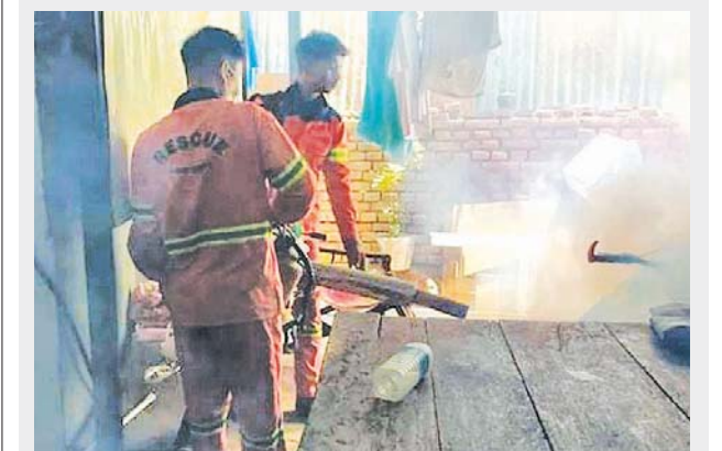
ညောင်ဦးမြို့နယ်အတွင်း သွေးလွန်တုပ်ကွေးရောဂါ ကြိုတင် ကာကွယ်နိုင်ရေးအတွက် ဆေးဖျန်းခြင်းလုပ်ငန်းများကို ညောင်ဦး မြို့နယ် အမှတ်(၅) အရန်မီးသတ်တပ်ဖွဲ့က အမှတ်(၂) နယ်မြေ ကျောင်းစုရပ်ကွက်အတွင်းနှင့် အနော်ရထာရပ်ကွက် ပုဂံမူကြို ကျောင်းဝင်းအတွင်း ဇူလိုင် ၂၈ ရက်က ဆောင်ရွက်ပေးစဉ်။ (ညောင်ဦးမြို့၌ ခြင်ဆေးဖျန်းလိုသူများအနေဖြင့် အမှတ်(၅) အရန် မီးသတ်တပ်ဖွဲ့ ဖုန်း- ၀၉-၄၀၁၃၄၄၀၅၇၊ ၀၉-၈၈၀၅၅၁၁၉၁ သို့ ဆက်သွယ်အကူအညီတောင်းခံနိုင်ကြောင်း သိရသည်။)

ရှင်းလင်းပွဲသို့ တိုင်းဒေသကြီး တရားလွှတ်တော် တရားသူကြီး များ၊ တိုင်းဒေသကြီး တရားရေး ဦးစီးမှူးနှင့် တရားရေးအရာရှိ များ၊ တိုင်းဒေသကြီး ဥပဒေချုပ်နှင့် ဥပဒေအရာရှိများ၊ ခရိုင်တရား သူကြီးများ၊ ရဲတပ်ဖွဲ့ဝင်များနှင့် ရှေ့နေများ တက်ရောက်ခဲ့ကြ သည်။