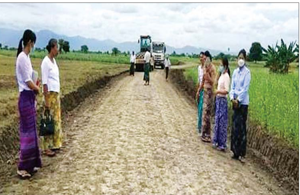
ဧက ၃၇၄၀ ကျော် အကျိုးပြုမည် ဖြစ်ကြောင်း၊ ဒေသခံပြည်သူများ အတွက် လယ်ယာသုံးစက်ပစ္စည်းများ သွားလာရေးနှင့် လယ်ယာ ထွက်ကုန်များ၏ သယ်ယူပို့ဆောင်ရေးများ အဆင်ပြေ စေရန်အတွက် တိုင်းဒေသကြီး ဦးစီးမှူးက ဆက်လက်ပြောသည်။