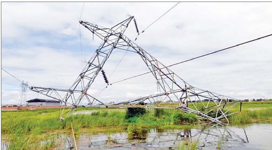
၁၃၂ ကေစီ ရွှေစာရ်-တံခွန်တိုင် ဓာတ်အားလိုင်းမှ ပြိုလဲပျက်စီးနေသည့် တာဝါတိုင်အမှတ် (၄၅) ကို တွေ့ရစဉ်။

၁။ လျှပ်စစ်စွမ်းအားဝန်ကြီးဌာန သည် တိုင်းဒေသကြီး/ပြည်နယ် များအလိုက် ပြည်သူလူထုနှင့် စက်မှုလက်မှု လုပ်ငန်းများတွင် ဓာတ်အား သုံးစွဲနိုင်ရန်အတွက် ဓာတ်အား ထုတ်လုပ်ပေးခြင်းနှင့် ဓာတ်အားပို့လွှတ်၊ ဖြန့်ဖြူးပေး ခြင်းများကို စဉ်ဆက်မပြတ် ဖြန့်ဖြူးနိုင်ရေး ဆောင်ရွက်လျက် ရှိသကဲ့သို့ တိုးတက်သုံးစွဲလာသည့် ဓာတ်အား သုံးစွဲမှုများအတွက် လည်း တိုးတက်ဖြန့်ဖြူးပေးနိုင်ရန် စီစဉ်ဆောင်ရွက်လျက်ရှိပါသည်။ ၂။ ပုံမှန်အချိန်တွင် အမြင့်ဆုံး ဓာတ်အား ထုတ်လုပ်နိုင်မှုသည် စာမျက်နှာ ၁၂ ကော်လံ ၁