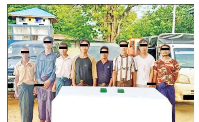
ဘိန်းဖြူများ သယ်ဆောင်ရာတွင် ပူးပေါင်းပါဝင်သူများအား သိမ်းဆည်းရမိသည့် သက်သေခံပစ္စည်းများနှင့်အတူ တွေ့ရစဉ်။

ဒေသကာလ တန်ဖိုးငွေကျပ် ၁ ဒသမ ၉၃ ဘီလီယံကျော်တန်ဖိုးရှိ ဘိန်းဖြူ ၇၇ ဒသမ ၅၂ ကီလို သိမ်းဆည်းရမိခဲ့ကြောင်း စစ်ဆေးဖော်ထုတ်ချက်အရ သိမ်းဆည်း