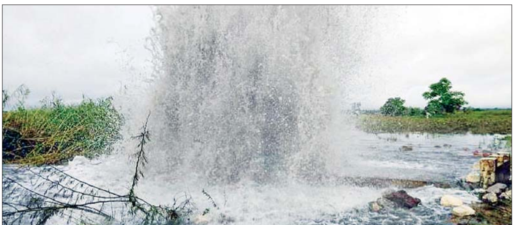
စက်ရုံကြီးများသို့ ပို့လွှတ်ထားသည့် သဘာဝဓာတ်ငွေ့ ပိုက်လိုင်း ဖောက်ခွဲ ဖျက်ဆီးခံရမှုကို တွေ့ရစဉ်။

၃။ သို့ရာတွင် (၂၁-၇-၂၀၂၂)ရက်နေ့၌ ဇေတီက ဓာတ်ငွေ့ပိုက်လိုင်းမှာ PDF အမည်ခံ အကြမ်းဖက်သောင်းကျန်းသူများ၏ မိုင်းဖြင့် ဖောက်ခွဲ ဖျက်ဆီးခံခဲ့ရသဖြင့် ၎င်းဓာတ်ငွေ့ရယူသုံးစွဲလျက်ရှိသည့် ဓာတ်အားပေး