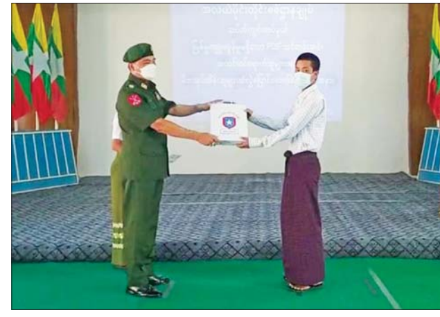
ပြည်နယ်အသီးသီး၌ ဥပဒေဘောင်အတွင်း ပြန်လည်ဝင်ရောက် လျက်ရှိကြသဖြင့် သက်ဆိုင်ရာ တာဝန်ရှိသူများက ၎င်းတို့၏ မိဘ အုပ်ထိန်းသူများထံသို့ လွှဲပြောင်းအပ်နှံပေးလျက်ရှိကြောင်း သတင်း ရရှိသည်။ သတင်းစဉ်

အေးချမ်းရေးနှင့် တရားဥပဒေဆိုင်ရာပုဒ်မများကို ရှင်းလင်းဆွေးနွေး ပြောကြားသည်။ ထို့နောက် ဥပဒေဘောင်အတွင်းဝင်ရောက်ခဲ့သည့် ပြစ်မှုကျူးလွန်ခြင်းမရှိခဲ့သော စဉ့်ကူးမြို့နယ်မှ PDF အဖွဲ့ဝင် အမျိုးသား သုံးဦးကို ဝန်ခံကတိလက်မှတ်ရေးထိုးစေကာ ၎င်းတို့၏ မိဘအုပ်ထိန်း သူများထံသို့ လွှဲပြောင်းအပ်နှံပြီး ထောက်ပံ့ပစ္စည်းများ ပေးအပ်သည်။ PDF အပါအဝင် အဖွဲ့အစည်းအမျိုးမျိုးတို့အနေဖြင့် နိုင်ငံတော်၏ ရှေ့လုပ်ငန်းစဉ်များတွင် ပါဝင်ပူးပေါင်းဆောင်ရွက်နိုင်ရေး သတ်မှတ် စည်းကမ်းချက်များနှင့်အညီ ဥပဒေဘောင်အတွင်းသို့ လက်နက်အပ်နှံပြီး ပြည်သူ့ဘဝသို့ ပြန်လည်ဝင်ရောက်ခြင်းပြုမည်ဆိုပါက ကြိုဆိုလက်ခံ သွားမည်ဖြစ်ကြောင်း နိုင်ငံတော်အစိုးရက ထုတ်ပြန်ထားပြီးဖြစ်ရာ ပြစ်မှုကျူးလွန်ခြင်းမရှိသော PDF အဖွဲ့ဝင်များက တိုင်းဒေသကြီးနှင့်