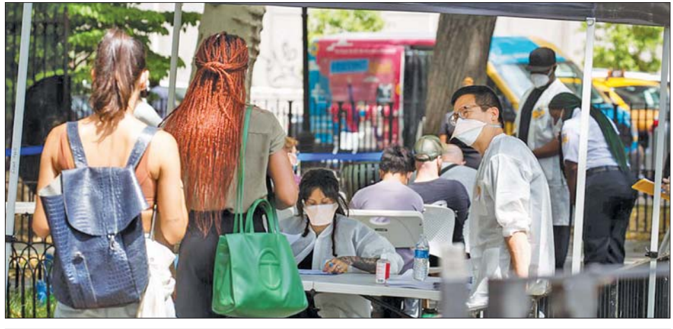
နယူးယောက်တွင် မျောက်ကျောက်ရောဂါကာကွယ်ဆေးထိုးနှံရန် စောင့်ဆိုင်းနေကြသူများ။

မျောက်ကျောက်ရောဂါ ကူးစက်ခံရသူ ၉၀၀ ဖြင့် အများဆုံးဖြစ်ပြီး ၎င်းနောက်တွင် ကယ်လီဖိုးနီးယားက ကူးစက်ခံရသူ ၃၅၆ ဦးနှင့် ဖလော်ရီဒါက ကူးစက်ခံရသူ ၂၄၇ ဦးရှိကြောင်း စီဒီစီ၏ ထုတ်ပြန်ချက်တွင် ဖော်ပြထားသည်။ ထို့ကြောင့် ပြည်သူ့ကျန်းမာရေး ကျွမ်းကျင် ပညာရှင်များက အမေရိကန် နိုင်ငံအနေဖြင့် မျောက်ကျောက်ရောဂါဖြစ်ပွားမှုကို ထိန်းချုပ်ရန် အရေးကြီးသော အချိန်ရောက်ရှိနေပြီဖြစ်ကြောင်း သတိပေးထားသည်။ ကမ္ဘာ့ကျန်းမာရေးအဖွဲ့သည် ဇူလိုင် ၂၃ ရက်က မျောက်ကျောက်ရောဂါဖြစ်ပွားမှုကို နိုင်ငံတကာ စိုးရိမ်ဖွယ်ရာ ပြည်သူ့ကျန်းမာရေး အရေးပေါ် အခြေအနေအဖြစ် ထုတ်ပြန်ကြေညာထားကြောင်း သိရသည်။ ဆင်ဟွာ