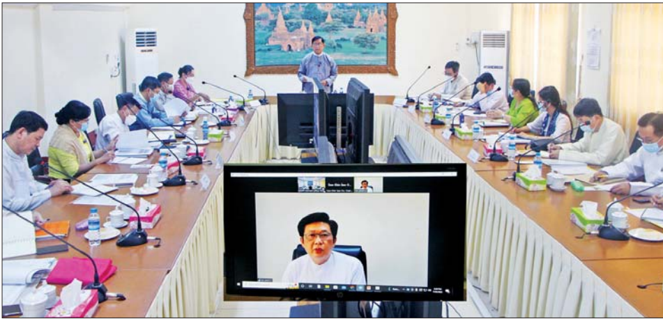
၂၀၂၂) ဖြင့် ဖွဲ့စည်းထားရှိပြီးဖြစ် ကြောင်း၊ မြန်မာနိုင်ငံတွင် ပြည်ပမှ စားသုံး ဆီတင်သွင်းမှု လျော့ကျ စေရေး၊ ပြည်တွင်းစားသုံးဆီဖူလုံ စေရေးတို့အတွက် နေကြာအပါ အဝင် ဆီထွက်သီးနှံများ ပိုမို စိုက်ပျိုးထုတ်လုပ်နိုင်ရန်နှင့် ဆီ ထွက်သီးနှံများကို အရည်အသွေး ကောင်း စားသုံးဆီများ ထုတ်လုပ် ရန် အဆင့်မီဆိတ်စက်များ လိုအပ် နေရာ လက်ရှိဆိတ်စက်များကို အဆင့်မြှင့်တင်ခြင်းနှင့် ခေတ်မီ ဆိတ်စက်အသစ်များ ထပ်မံတိုးချဲ့ တည်ဆောက်ရန်အတွက် ရင်းနှီး မြှုပ်နှံမှု လိုအပ်ချက်ကို ဖြည့်ဆည်းပေးရန် ဖြစ်ကြောင်း၊ မြန်မာနိုင်ငံ ဆိတ်လုပ်ငန်းရှင် များ အသင်းအနေဖြင့် တိုင်းဒေသ

နေပြည်တော် ဇူလိုင် ၂၆ မြန်မာနိုင်ငံ ဆိတ်လုပ်ငန်းများ ဖွံ့ဖြိုးရေးချေးငွေ စီမံခန့်ခွဲမှု လုပ်ငန်းအဖွဲ့၏ ပထမအကြိမ် အစည်းအဝေး (၁/၂၀၂၂-၂၀၂၃) ကို ယနေ့ မွန်းလွဲပိုင်းတွင် စီမံကိန်းနှင့် ဘဏ္ဍာရေးဝန်ကြီး ဌာန ပြည်ထောင်စုဝန်ကြီးရုံး အစည်းအဝေးခန်းမ၌ ကျင်းပ သည်။ (ယာပုံ) အစည်းအဝေးတွင် စီမံကိန်း နှင့် ဘဏ္ဍာရေးဝန်ကြီးဌာန၊ ဒုတိယဝန်ကြီးဦးမောင်မောင်ဝင်း က ဆိတ်လုပ်ငန်းများ ဖွံ့ဖြိုးရေး ချေးငွေ စီမံခန့်ခွဲမှုလုပ်ငန်းအဖွဲ့ ကို နိုင်ငံတော်စီမံအုပ်ချုပ်ရေး ကောင်စီ၏ ဇူလိုင် ၆ ရက် ရက်စွဲပါ အမိန့်ကြော်ငြာစာအမှတ် (၁၁၈/