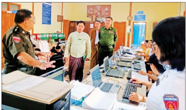
အဆိုပါလုပ်ငန်းများ ဆောင်ရွက်နေမှုကို ဇူလိုင် ၁၈ ရက်မှ စတင်၍ ရက်ပေါင်း ၅၀ အတွင်း အိမ်ထောင်စုလူဦးရေစာရင်း စုစုပေါင်း ၁၉၇၉၅ ဦးကို ပြီးစီးအောင် ဆောင်ရွက် သွားမည်ဖြစ်ကြောင်း သိရသည်။ မိုးမိုးထွေး (ပြန်/ဆက်)

ဥက္ကဋ္ဌနှင့် တာဝန်ရှိသူများက ပါတီစုံဒီမိုကရေစီ အထွေထွေ ရွေးကောက်ပွဲများတွင် မဲဆန္ဒရှင် စာရင်းများ တိကျမှန်ကန်စေရေး နှင့် အိမ်ထောင်စုလူဦးရေစာရင်း (ပုံစံ-၆၆/၆) များ တိကျမှန်ကန်မှုရှိ စေရေးအတွက် မြို့နယ်အတွင်းရှိ အိမ်ထောင်စု လူဦးရေစာရင်း များကို e-ID စနစ်ဖြင့် Software အသုံးပြုကာ Database အတွင်း ထည့်သွင်းသည့် လုပ်ငန်းများ ဆောင်ရွက်နေမှုကို ကြည့်ရှုစစ် ဆေးပြီး(ယာပုံ) လိုအပ်သည်များ ဖြည့်ဆည်း ဆောင်ရွက်ပေးသည်။