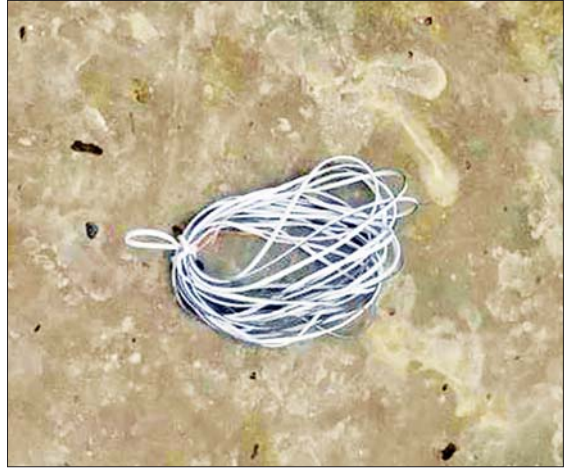
သဘာဝဓာတ်ငွေ့ပိုက်လိုင်းဖောက်ခွဲရာတွင် အသုံးပြုသည့် ယမ်းကြိုးခွေကို တွေ့ရစဉ်။