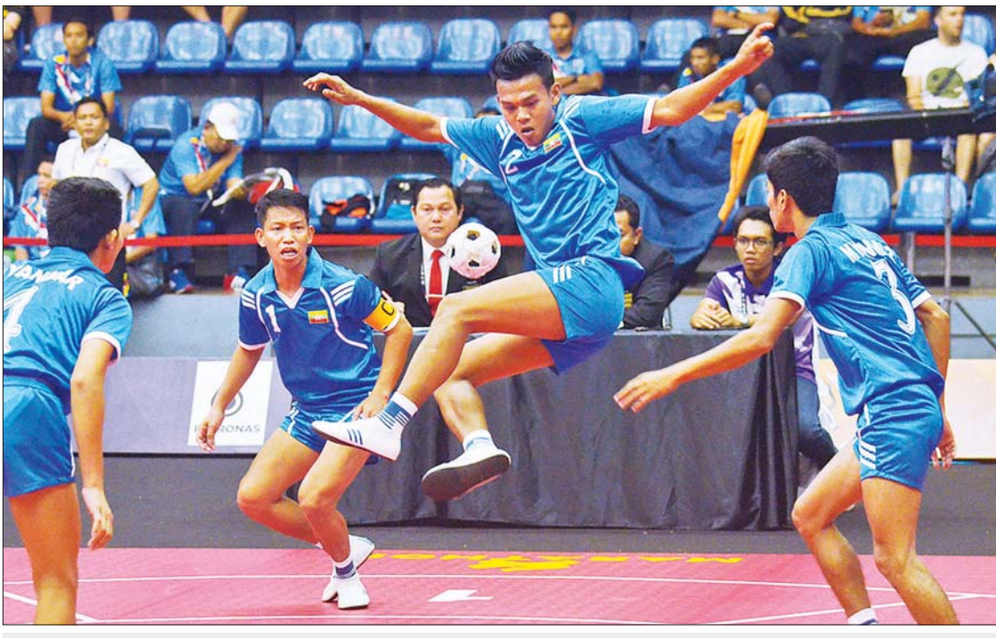
၂၀၁၇ မလေးရှားဆီးဂိမ်းပြိုင်ပွဲတွင် ရွှေတံဆိပ် ရရှိခဲ့သည့် မြန်မာခြင်းလုံးအသင်း ယှဉ်ပြိုင်စဉ်။ ဓာတ်ပုံ-သော်ကြီး

ရန်ကုန် ဇူလိုင် ၂၆ မြန်မာ့ရိုးရာ အားကစားနည်း ဖြစ်သည့် ခြင်းလုံးအားကစားနည်းသည် ကမ္ဘောဒီးယားနိုင်ငံက အိမ်ရှင်အဖြစ် လက်ခံကျင်းပမည့် (၃၂)ကြိမ်မြောက် ဆီးဂိမ်းပြိုင်ပွဲတွင် ပြန်လည်ပါဝင်လာမည် ဖြစ်သည်။ (၃၂) ကြိမ်မြောက် ဆီးဂိမ်းပြိုင်ပွဲကို ၂၀၂၃ ခုနှစ် မေလတွင် ကျင်းပမည်ဖြစ်ပြီး ကမ္ဘောဒီးယား အိုလံပစ်ကော်မတီသည် လာမည့် ဆီးဂိမ်းပြိုင်ပွဲတွင် ဆုတံဆိပ်ချီးမြှင့်မည့် အားကစားနည်း ၃၉ မျိုး၊ သရုပ်ပြအားကစားနည်း တစ်မျိုး စုစုပေါင်း အားကစားနည်း ၄၀ ထည့်သွင်းကျင်းပမည် ဖြစ်သည်။ စာမျက်နှာ ၅ ကော်လံ ၁ ●