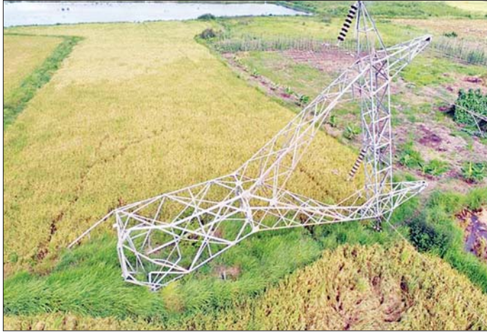
၁၃၂ ကေဗီ ရွှေစာရံ-တံခွန်တိုင် ဓာတ်အားလိုင်းမှ ပြုလုပ်ပျက်စီးနေသည့် တာဝါတိုင် အမှတ် (၄၄) ကို တွေ့ရစဉ်။