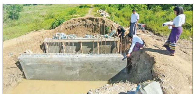
ဂွမြို့နယ်၌ ကုန်ထုတ်လမ်းပေါ်ရှိ ပြန်တံတား ၁၀ စင်း တည်ဆောက်နေမှု ကွင်းဆင်းစစ်ဆေး

ဂ ဇူလိုင် ၂၆ ရခိုင်ပြည်နယ် ဂွမြို့နယ် ကျေးလက် ဒေသ ဖွံ့ဖြိုးတိုးတက်ရေးဦးစီးဌာန က ၂၀၂၂-၂၀၂၃ ဘဏ္ဍာနှစ် ပြည်ထောင်စုရန်ပုံငွေဖြင့် တင်ဒါ အောင်မြင်သည့် ကုမ္ပဏီက တာဝန် ယူဆောင်ရွက်နေသော ကံ့ကော် တထောင်ကျေးရွာ ကုန်ထုတ်လမ်း ပေါ်ရှိ ပြန်တံတား ၁၀ စင်း တည်ဆောက်နေမှုကို ဇူလိုင် ၂၅ ရက်က ဂွမြို့နယ်ကျေးလက်ဦးစီးမှူး