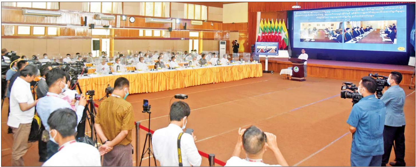
နိုင်ငံတော်စီမံအုပ်ချုပ်ရေးကောင်စီ၊ သတင်းထုတ်ပြန်ရေးအဖွဲ့ (၁၈) ကြိမ်မြောက် သတင်းစာရှင်းလင်းပွဲပြုလုပ်စဉ်။

နေပြည်တော် ဇူလိုင် ၂၆ နိုင်ငံတော်စီမံအုပ်ချုပ်ရေးကောင်စီ၊ သတင်းထုတ်ပြန်ရေးအဖွဲ့၏ (၁၈) ကြိမ်မြောက် သတင်းစာရှင်းလင်းပွဲကို ယနေ့မွန်းလွဲပိုင်းတွင် ပြန်ကြားရေးဝန်ကြီးဌာန၌ ကျင်းပပြုလုပ်ရာ နိုင်ငံတော်စီမံအုပ်ချုပ်ရေးကောင်စီ၊ သတင်းထုတ်ပြန်ရေးအဖွဲ့ ခေါင်းဆောင် ဗိုလ်ချုပ် ဇော်မင်းထွန်းက ရှုရှားနိုင်ငံခရီးစဉ်ဆိုင်ရာ ကိစ္စရပ်များ၊ ဘဏ္ဍာရေးဆိုင်ရာကိစ္စရပ်များ၊ အကြမ်းဖက်အဖွဲ့အစည်းအချို့နှင့် ပြည်ပျက်မီဒီယာအချို့တို့က လုပ်ကြံဖန်တီးထားသည့် ပျူစောထီးဟူသည့် အခေါ်အဝေါ်၊ တိုင်းရင်းသား လက်နက်ကိုင်ဆိုင်ရာ ကိစ္စရပ်များ၊ ပညာရေးဆိုင်ရာကိစ္စရပ်များနှင့် ဆက်စပ်မှုများကိုလည်းကောင်း၊ ပြည်ထောင်စုရွေးကောက်ပွဲကော်မရှင်အဖွဲ့ဝင် ဦးခင်မောင်ဦးက ရွေးကောက်ပွဲကော်မရှင်ဆိုင်ရာ ကိစ္စရပ်များကိုလည်းကောင်း ရှင်းလင်းပြောကြားကြသည်။