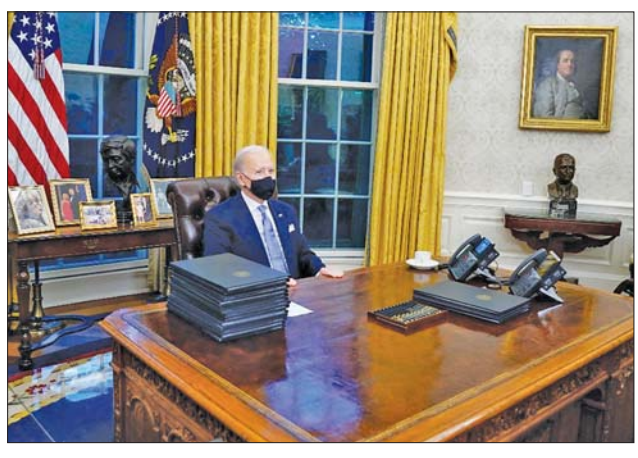
အမေရိကန်သမ္မတ ဂျိုးဘိုင်ဒင်။ ကြောင်း ပြောကြားခဲ့သည်။ ကိုဗစ်-၁၉ အခြေအနေမှလည်း ထို့အပြင် အိမ်ဖြူတော်၌ သီးသန့်ခွဲခြားနေထိုင်လျက်ရှိစဉ် ကြောင်း ၎င်းက ပြောသည်။ ဆင်ဟွာ

ဝါရှင်တန် ဇူလိုင် ၂၆ ယခု သီတင်းပတ်အဆုံးတွင် လူကိုယ်တိုင် နိုင်ငံခေါင်းဆောင်တာဝန်များ ပြန်လည်ထမ်းဆောင်နိုင်တော့မည်ဖြစ်ကြောင်း အမေရိကန်သမ္မတ ဂျိုးဘိုင်ဒင်က သတင်းထောက်များကို ဇူလိုင် ၂၅ ရက်က ပြောကြားလိုက်သည်။ လွန်ခဲ့သော ကြာသပတေးနေ့က ကိုဗစ်-၁၉ ကူးစက်ဖြစ်ပွားခဲ့သော အမေရိကန်သမ္မတ ဂျိုးဘိုင်ဒင်က အုပ်ချုပ်ရေးအရာရှိများနှင့် အွန်လိုင်း အစည်းအဝေး၌ တွေ့ဆုံပြီးနောက် မိမိအနေဖြင့် အခြေအနေကောင်းမွန်နေပြီဖြစ်