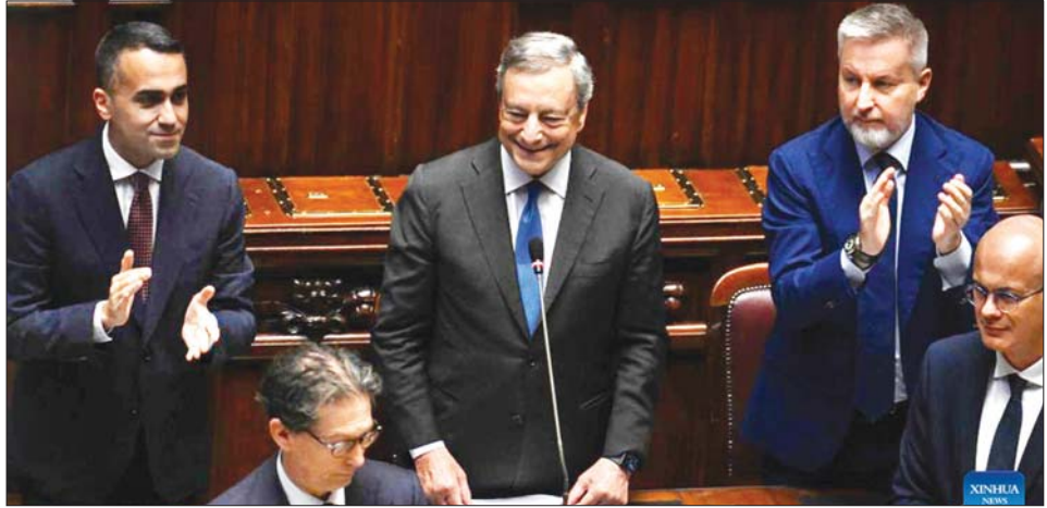
အီတလီဝန်ကြီးချုပ် မာရီယို ဒရက်ဂီ (လယ်) ဇူလိုင် (၂၁) ရက်က အောက်လွှတ်တော်၌ မိန့်ခွန်းပြောနေစဉ်။