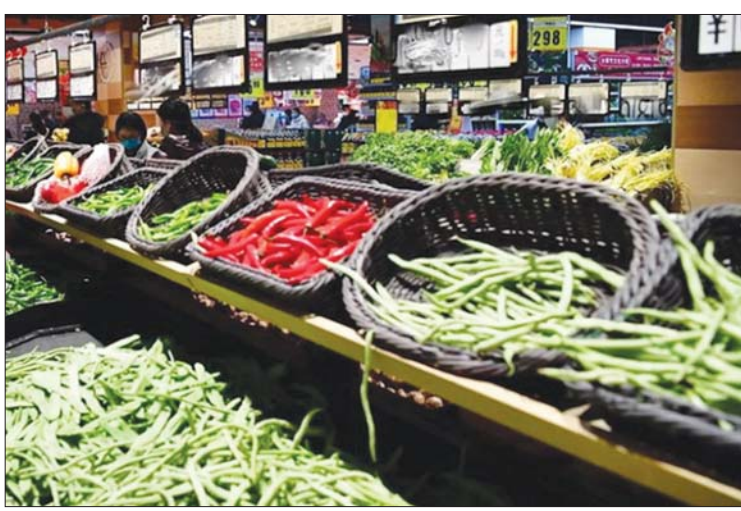
လာအိုနိုင်ငံ ဈေးကွက်အတွင်း တွေ့ရသော ဗီယက်နမ်နိုင်ငံထွက် ဟင်းသီး ဟင်းရွက်များ။

လာအိုနိုင်ငံသည် ပို့ကုန်တင်ပို့သော ပြည်ပနိုင်ငံများထံမှ အရည်အသွေး ထောက်ခံချက် (Quality Certification) အများစုကို လက်ခံအသိအမှတ်ပြုခြင်း ကြောင့် ဗီယက်နမ်ရင်းနှီးမြှုပ်နှံသူ များစွာက လာအိုဈေးကွက်အား ဦးတည် ဈေးကွက်တစ်ရပ်အဖြစ် နှစ်ခြိုက်မှုရရှိ လာခဲ့ကြောင်း သိရသည်။