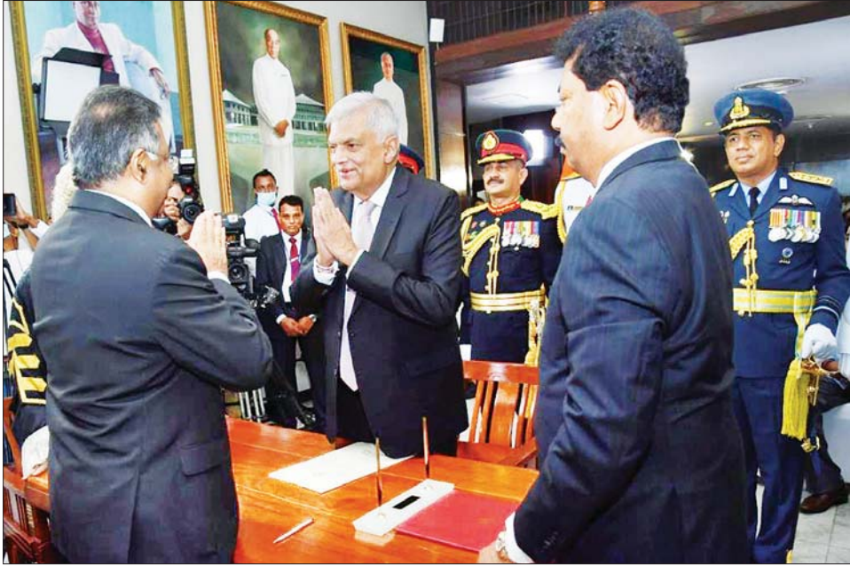
သီရိလင်္ကာနိုင်ငံ ကိုလံဘိုမြို့၊ လွှတ်တော်အဆောက်အအုံတွင် ဇူလိုင် ၂၁ ရက်က ကျင်းပပြုလုပ်သော သမ္မတအဖြစ် ကျမ်းသစ္စာကျိန်ဆိုပွဲ၌ ရာနေးလ်ဝစ်ကရမ်ဆင်းသည် ရှစ်ယောက်မြောက် သမ္မတအဖြစ် တရားသူကြီးချုပ် ဂျာရန်သာဂျာရာဆူရီယာရှေ့မှောက်တွင် ကျမ်းသစ္စာကျိန်ဆိုနေစဉ်။

ကိုလံဘို ဇူလိုင် ၂၁ သီရိလင်္ကာ အစိုးရအဖွဲ့သစ် ဝန်ကြီးများသည် ဇူလိုင် ၂၂ ရက်တွင် ဝန်ကြီးချုပ်ရုံး၌ ကျမ်းသစ္စာကျိန်ဆိုကြမည်ဖြစ်သည်။ သမ္မတ၏ သတင်းမီဒီယာ ဌာနက အဆိုပါကျမ်းသစ္စာကျိန်ဆိုပွဲကို နံနက် ၉ နာရီတွင် စတင်ကျင်းပမည်ဖြစ်ကြောင်း ဖော်ပြခဲ့သည်။ ရာနေးလ်ဝစ်ကရမ်ဆင်းသည် ဇူလိုင် ၂၁ ရက်က တရားသူကြီးချုပ် ဂျာရန်သာဂျာရာ ဆူရီယာ ရှေ့မှောက်တွင် သီရိလင်္ကာသမ္မတ အဖြစ် ကျမ်းသစ္စာကျိန်ဆိုခဲ့သည်။ ဝစ်ကရမ်ဆင်းသည် ဇူလိုင် ၂၀ ရက်က လွှတ်တော်တွင်ကျင်းပသော သမ္မတရွေးချယ်ပွဲ၌ နိုင်ငံ၏ သမ္မတအဖြစ် ရွေးချယ်ခံခဲ့ရသည်။