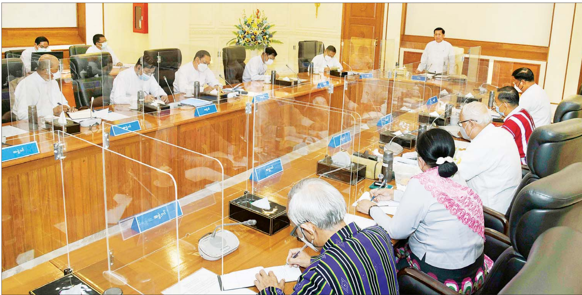
နိုင်ငံတော်စီမံအုပ်ချုပ်ရေးကောင်စီဥက္ကဋ္ဌ နိုင်ငံတော်ဝန်ကြီးချုပ် ဗိုလ်ချုပ်မှူးကြီး မင်းအောင်လှိုင် နိုင်ငံတော်စီမံအုပ်ချုပ်ရေးကောင်စီ အစည်းအဝေး (၆/၂၀၂၂) တွင် အမှာစကားပြောကြားစဉ်။

နေပြည်တော် ဇူလိုင် ၂၁ နိုင်ငံတော်စီမံအုပ်ချုပ်ရေးကောင်စီ အစည်းအဝေး (၆/၂၀၂၂) ကို ယနေ့နံနက်ပိုင်းတွင် နေပြည်တော်ရှိ နိုင်ငံတော်စီမံအုပ်ချုပ်ရေးကောင်စီဥက္ကဋ္ဌရုံး အစည်းအဝေးခန်းမ၌ကျင်းပရာ နိုင်ငံတော်စီမံအုပ်ချုပ်ရေးကောင်စီဥက္ကဋ္ဌ နိုင်ငံတော်ဝန်ကြီးချုပ် ဗိုလ်ချုပ်မှူးကြီး မင်းအောင်လှိုင် တက်ရောက်အမှာစကား ပြောကြားသည်။ စာမျက်နှာ ၃ ကော်လံ ၁ ၀