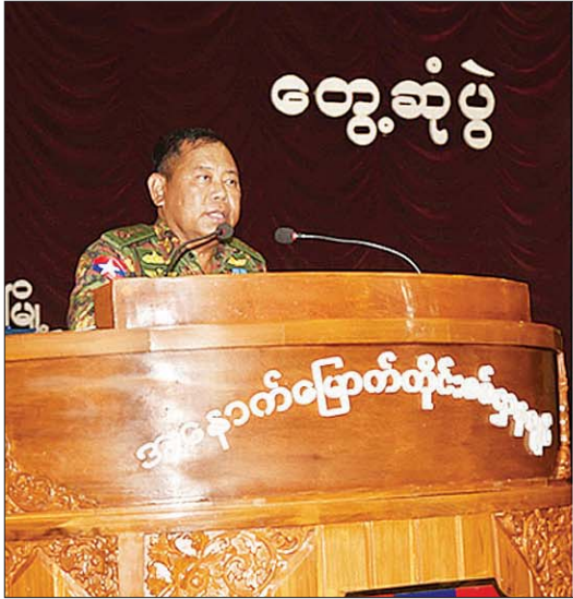
ဂုဏ်ပြုထောက်ပံ့ငွေများ ပေးအပ်

ဆက်လက်၍ ပြည်ထောင်စုဝန်ကြီးသည် တာဝန်ရှိသူများနှင့်အတူ မုံရွာမြို့ နယ်မြေခံ တပ်နယ်ခန်းမ၌ စစ်ကိုင်းတိုင်းဒေသကြီးအတွင်း လုံခြုံရေး၊ ရပ်ရွာအေးချမ်းသာယာရေးနှင့် တရားဥပဒေစိုးမိုးရေး တာဝန် ထမ်းဆောင်နေကြသည့် တပ်မတော်သားများ၊ ရဲတပ်ဖွဲ့ဝင်များနှင့် လည်းကောင်း၊ မွန်းလွှဲပိုင်းတွင် မကွေးတိုင်းဒေသကြီး ပခုက္ကူမြို့ နယ်မြေခံတပ်နယ်ခန်းမတွင် ပခုက္ကူခရိုင်အတွင်း လုံခြုံရေးနှင့် တရား ဥပဒေစိုးမိုးရေးအတွက် တာဝန်ထမ်းဆောင်နေကြသည့် တပ်မတော် သားများ၊ ရဲတပ်ဖွဲ့ဝင်များနှင့်လည်းကောင်း၊ ဇူလိုင် ၂၁ ရက် နံနက်ပိုင်း တွင် ကန့်ဘလူမြို့ ခရိုင်စုပေါင်းရုံး၌လည်းကောင်း၊ ရေဦးမြို့ “ရွှေဒီ” ခန်းမ၌လည်းကောင်း၊ လုံခြုံရေးနှင့် တရားဥပဒေစိုးမိုးရေး တာဝန်ထမ်း ဆောင်နေသည့် တပ်မတော်သားများနှင့် ရဲတပ်ဖွဲ့ဝင်များကို တွေ့ဆုံပြီး လက်ရှိနိုင်ငံတော်၌ ဖြစ်ပေါ်နေသော အကြမ်းဖက်တိုက်ခိုက်မှုနှင့် နယ်မြေအေးချမ်းတည်ငြိမ်မှု တိုးတက်လာသည့် အခြေအနေများကို ရှင်းလင်းချပြပြီး လုံခြုံရေး၊ တရားဥပဒေစိုးမိုးရေးလုပ်ငန်းများ ဆောင် ရွက်ရာတွင် မြန်မာနိုင်ငံရဲတပ်ဖွဲ့၏ ရည်မှန်းချက်တာဝန် (၄)ရပ်အပေါ် အကောင်အထည်ဖော်ဆောင်ရွက်နေမှု၊ မြန်မာနိုင်ငံ ရဲတပ်ဖွဲ့ဝင်များ လိုက်နာရမည့် အစဉ်အလာကောင်း(၁၂)ရပ်တွင်ပါရှိသည့် “နိုင်ငံတော် တွင် အရေးကြီးတိုင်း နောင်တော်တပ်မတော်နှင့် တစ်စိတ်တစ်ပိုင်းတည်း လက်တွဲ၍ ကာကွယ်စောင့်ရှောက်ခဲ့သည့် တပ်ဖွဲ့ဖြစ်သည်”ဟူသည့် အချက်နှင့်အညီ တပ်မတော်နှင့်အတူ လက်တွဲ၍ လက်ရှိနိုင်ငံတော်၏ အခြေအနေကို တည်ငြိမ်အေးချမ်းရန် ဆောင်ရွက်သွားရန်လိုအပ် ကြောင်း။