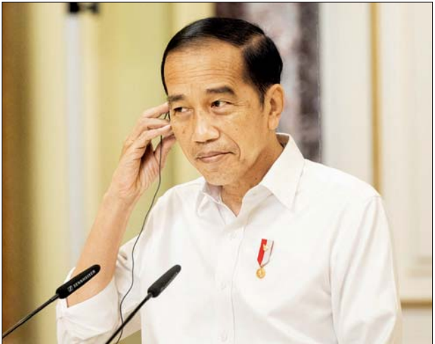
အင်ဒိုနီးရှားသမ္မတ ဂျိုကိုဝီဒိုဒို။

ပေကျင်း ဇူလိုင် ၂၁ တရုတ်သမ္မတ ရှီကျင့်ဖျင်၏ ဖိတ်ကြားချက်အရ အင်ဒိုနီးရှား သမ္မတ ဂျိုကိုဝီဒိုဒိုသည် တရုတ်နိုင်ငံသို့ ဇူလိုင် ၂၅ ရက်မှ ၂၆ ရက်အထိ တရားဝင်ခရီးစဉ် လာရောက်မည်ဖြစ်ကြောင်း တရုတ်နိုင်ငံခြားရေးဝန်ကြီးဌာန ပြောရေးဆိုခွင့်ရှိသူ ဟွာချူရင်က ဇူလိုင် ၂၁ ရက်က ကြေညာခဲ့သည်။ လာရောက်မည့် ခရီးစဉ်နှင့် ပတ်သက်ပြီး မေးခွန်းများ မေးမြန်းမှုအပေါ် နိုင်ငံခြားရေး ဝန်ကြီးဌာန ပြောရေးဆိုခွင့်ရှိသူ ဝမ်ဝင်ဘင်က ဂျိုကိုဝီဒိုဒိုသည် ပေကျင်းဆောင်းရာသီ အိုလံပစ် အားကစားပြိုင်ပွဲ ကျင်းပပြီး နောက် တရုတ်နိုင်ငံသို့ အလည် အပတ်ခရီးလာရောက်မည့် ပထမဆုံး နိုင်ငံရပ်ခြားခေါင်းဆောင် တစ်ဦးဖြစ်ကြောင်း သတင်းစာ ရှင်းလင်းပွဲတွင် ပြောကြားခဲ့သည်။