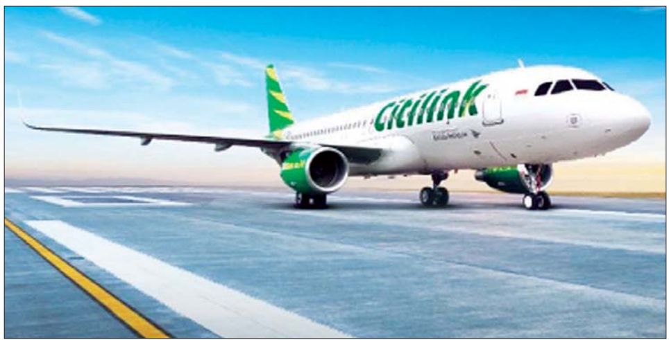
စီးတီးလင့်ခ်လေကြောင်းလိုင်းမှ ခရီးသည်လေယာဉ်တစ်စင်းကို တွေ့ရစဉ်။