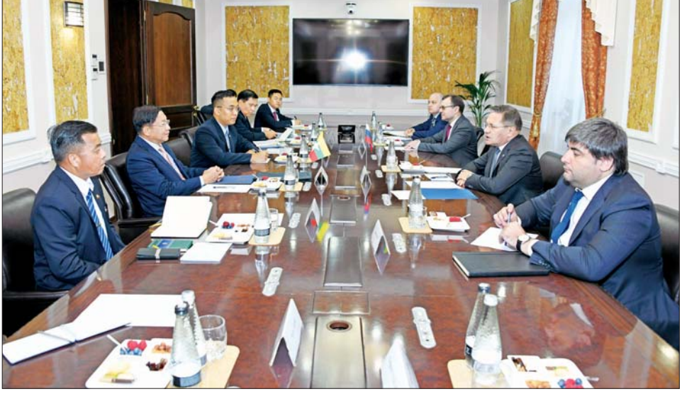
နိုင်ငံတော်စီမံအုပ်ချုပ်ရေးကောင်စီဥက္ကဋ္ဌ နိုင်ငံတော်ဝန်ကြီးချုပ် ဗိုလ်ချုပ်မှူးကြီး မင်းအောင်လှိုင် Rosatom State Corporations ၏ အထွေထွေညွှန်ကြားရေးမှူးချုပ် Mr. Alexey Likhachev နှင့် တွေ့ဆုံဆွေးနွေးစဉ်။