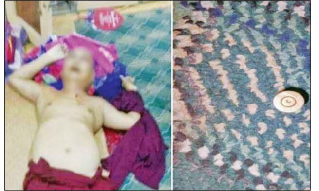
PDF အမည်ခံ အကြမ်းဖက်သမား၏ သေနတ်ဖြင့် ပစ်ခတ်မှုကြောင့် ပျံလွန်တော်မူခဲ့သည့် ဆရာတော် ဥူးကုသလ။

အကြောင်းမဲ့ အကြမ်းဖက် သတ်ဖြတ်မှုကြောင့် နိုင်ငံတော်အတွင်း သံဃာတော် ၅၁ ပါးနှင့် သီလရှင်ဆရာကြီး တစ်ပါးတို့ ဘဝနတ်ထံ ပျံလွန်တော်မူခဲ့ပြီဖြစ်ကြောင်းနှင့် အထက်ပါဖြစ်စဉ်မှ သံဃာတော်အား ဘုန်းကြီးကျောင်းအတွင်း ဝင်ရောက် သတ်ဖြတ်ခဲ့သည့် အကြမ်းဖက်သမားများအား ဖော်ထုတ်ဖမ်းဆီး၍ ဥပဒေနှင့်အညီ အရေးယူနိုင်ရေး လုံခြုံရေးတပ်ဖွဲ့ဝင်များက ဆက်လက်ဆောင်ရွက်လျက်ရှိကြောင်း သတင်းရရှိသည်။ သတင်းစဉ်