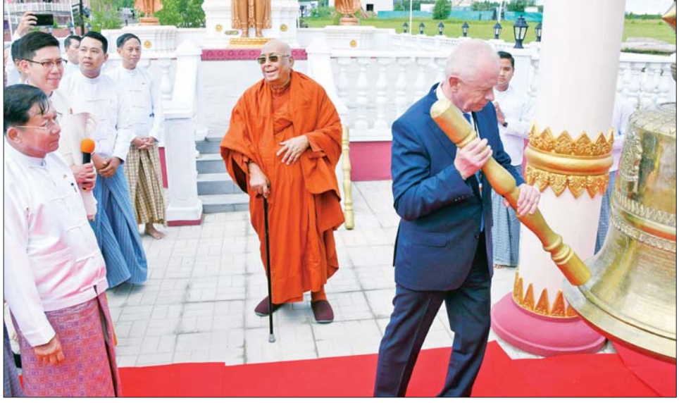
ရှုရှားကာကွယ်ရေးဝန်ကြီးဌာန ဒုတိယဝန်ကြီး Colonel General Alexander Vasilievich Fomin (အလက်ဇန်းဒါး ဗာစီးလီယယ်ဖစ် ဖိုမင်) အောင်ခေါင်းလောင်းတော်အား သုံးချက်ထိုးခတ် ပူဇော်စဉ်။