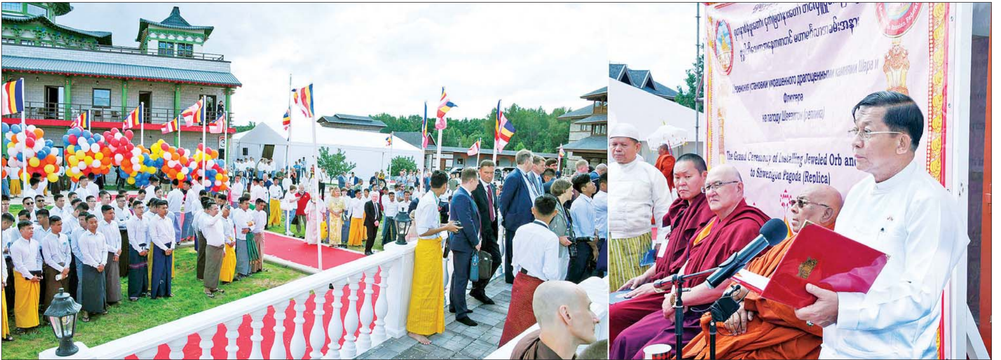
နိုင်ငံတော်စီမံအုပ်ချုပ်ရေးကောင်စီဥက္ကဋ္ဌ နိုင်ငံတော်ဝန်ကြီးချုပ် ဗိုလ်ချုပ်မှူးကြီး မင်းအောင်လှိုင် ရွှေစည်းခုံပုံတူစေတီတော်ကြီး ရတနာစိန်ဖူးတော်၊ ငှက်မြတ်နားတော် တင်လှူပူဇော်ပွဲနှင့် ဗုဒ္ဓါဘိသေက အနေကတောင် မဟာမင်္ဂလာအခမ်းအနားတွင် ဝမ်းမြောက်ကြောင်းလျှောက်ထားစဉ်။