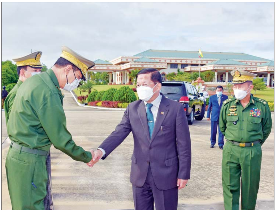
နိုင်ငံတော်စီမံအုပ်ချုပ်ရေးကောင်စီဥက္ကဋ္ဌ နိုင်ငံတော်ဝန်ကြီးချုပ် ဗိုလ်ချုပ်မှူးကြီး မင်းအောင်လှိုင် ရုရှားဖက်ဒရေးရှင်းနိုင်ငံသို့ ထွက်ခွာရာ နေပြည်တော်တပ်မတော်လေဆိပ်၌ ပို့ဆောင်နှုတ်ဆက်သူများကို တွေ့ရစဉ်။

ကောင်စီဥက္ကဋ္ဌ နိုင်ငံတော် ဝန်ကြီးချုပ်နှင့် အဖွဲ့ဝင်များသည် ဇူလိုင် ၁၁ ရက်တွင် ရုရှား- အာဆီယံ စီးပွားရေးကောင်စီ ဥက္ကဋ္ဌ Mr. Ivan Polyakov (အီဗန် ပါလျာကော့) ဦးဆောင်သည့် ကိုယ်စားလှယ်အဖွဲ့အား မော်စကို ဟိုတယ်ဧည့်ခန်းမ၌ တွေ့ဆုံ၍ စိုက်ပျိုးရေးကို အခြေခံသည့် ထုတ်ကုန်များ တင်ပို့နိုင်ရေးနှင့် ဆီထွက်သီးနှံ စိုက်ပျိုးထုတ်လုပ်မှု အတွက် နည်းပညာလိုအပ်ချက် များကို ပူးပေါင်းဆောင်ရွက်နိုင် မည့် အခြေအနေ၊ လျှပ်စစ်