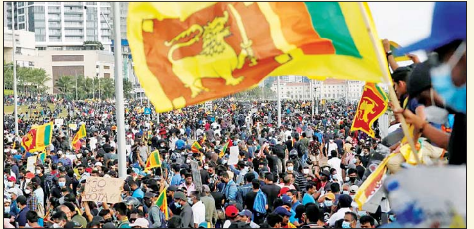
သီရိလင်္ကာနိုင်ငံ၌ စီးပွားရေးပျက်ကပ်ဆိုင်မှုကြောင့် အစိုးရဆန့်ကျင် ဆန္ဒပြနေသူများကို တွေ့ရစဉ်။