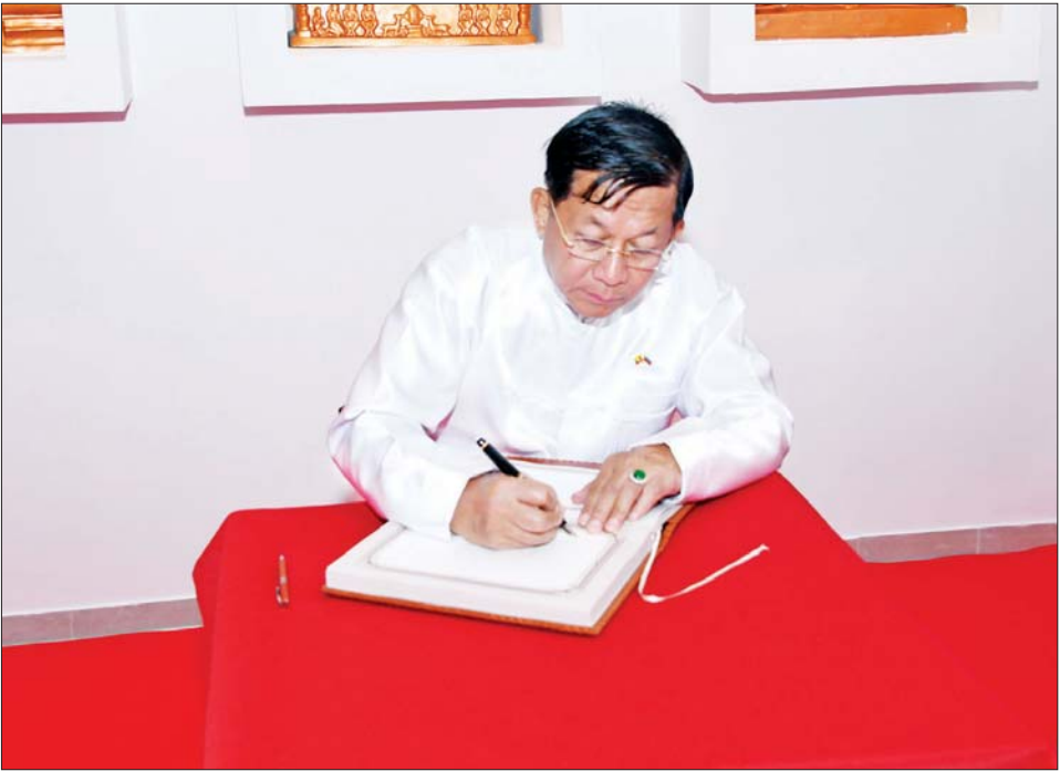
နိုင်ငံတော်စီမံအုပ်ချုပ်ရေးကောင်စီဥက္ကဋ္ဌ နိုင်ငံတော်ဝန်ကြီးချုပ် ဗိုလ်ချုပ်မှူးကြီး မင်းအောင်လှိုင် စေတီတော်ကြီး ဧည့်သည်တော်မှတ်တမ်းစာအုပ်တွင် လက်မှတ်ရေးထိုးစဉ်။

ထို့နောက် နိုင်ငံတော်စီမံအုပ်ချုပ်ရေးကောင်စီဥက္ကဋ္ဌ နိုင်ငံတော်ဝန်ကြီးချုပ်သည် ရုရှားဖက်ဒရေးရှင်းနိုင်ငံရှိ မြန်မာ့တပ်မတော်မှ ပညာတော်သင် သင်တန်းသားအရာရှိများအား ETHNOMIR ကမ္ဘာ့ယဉ်ကျေးမှုမြို့တော်ရှိ ဧည့်ခန်းမဆောင်၌ တွေ့ဆုံ၍ ယခုရွှေစည်းခုံပုံတူစေတီတော်ကြီး ရတနာ