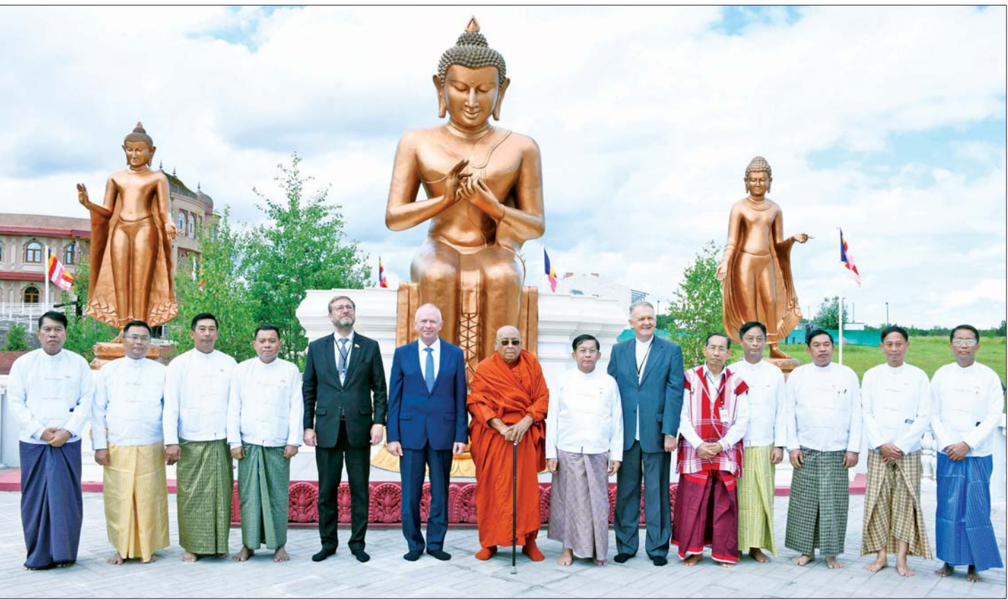
သီတဂူဆရာတော်ကြီး၊ နိုင်ငံတော်စီမံအုပ်ချုပ်ရေးကောင်စီဥက္ကဋ္ဌ နိုင်ငံတော်ဝန်ကြီးချုပ် ဗိုလ်ချုပ်မှူးကြီး မင်းအောင်လှိုင်နှင့် အဖွဲ့ဝင်များ၊ ရှုရှားကာကွယ်ရေးဝန်ကြီးဌာန ဒုတိယဝန်ကြီးနှင့် အဖွဲ့တို့ စုပေါင်းမှတ်တမ်းတင် ဓာတ်ပုံရိုက်စဉ်။

ကမ္ဘာ့ရှေးဟောင်းယဉ်ကျေးမှုစာရင်းဝင် ပုဂံမြို့တွင် တည်ရှိသည့် မူလရွှေစည်းခုံ စေတီတော်မြတ်ကြီးကို ပထမမြန်မာနိုင်ငံတော် စတင်တည်ထောင်ခဲ့သည့် အနော်ရထာ မင်းတရားကြီးက ရှင်အရဟံမထေရ်မြတ်၏ ဩဝါဒံယူ၍ လွန်ခဲ့သည့်