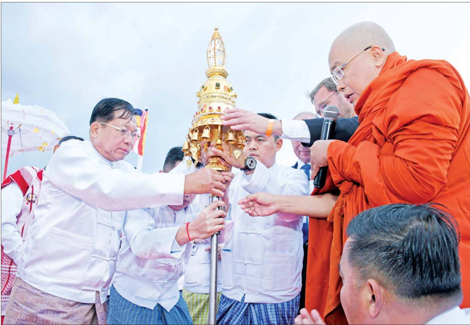
နိုင်ငံတော်စီမံအုပ်ချုပ်ရေးကောင်စီဥက္ကဋ္ဌ နိုင်ငံတော်ဝန်ကြီးချုပ် ဗိုလ်ချုပ်မှူးကြီး မင်းအောင်လှိုင်နှင့် အဖွဲ့ဝင်များ ရတနာစိန်ဖူးတော်၊ ငှက်မြတ်နားတော်တို့ကို ရွှေစည်းခုံပုံတူစေတီတော်အတွက်သို့ ပင့်ဆောင်တင်ဆက်ပူဇော်စဉ်။

နေပြည်တော် ဇူလိုင် ၁၂ ရုရှားဖက်ဒရေးရှင်း နိုင်ငံ မော်စကိုမြို့ ကာလုဂါပြည်နယ် ETHNOMIR ကမ္ဘာ့ယဉ်ကျေးမှုမြို့တော်ရှိ ရွှေစည်းခုံပုံတူစေတီတော်ကြီး ရတနာစိန်ဖူးတော်၊ ငှက်မြတ်နားတော် တင်လှူပူဇော်ပွဲနှင့် ဗုဒ္ဓါဘိသေက အနေကဇာတင် မဟာမင်္ဂလာ အခမ်းအနားကို သာသနာတော်နှစ် ၂၅၆၆ ခုနှစ်၊ ကောဇာသက္ကရာဇ် ၁၃၈၄ ခုနှစ်၊ ဝါဆိုလပြည့်နေ့ဖြစ်သည့် ယနေ့ နံနက်ပိုင်းတွင် ကျင်းပပြုလုပ်ရာ သီတဂူကမ္ဘာ့ဗုဒ္ဓတက္ကသိုလ်များ၏ အဓိပတိ အဘိဓမ္မမဟာရဋ္ဌဂုရု၊ အဘိဓမ္မအဂ္ဂ မဟာသဒ္ဓမ္မဇောတိက၊ မဟာဓမ္မကထိကဗဟုဇနဟိတဓရ၊ ရွှေကျင်နိကာယဥက္ကဋ္ဌ ရွှေကျင်သာသနာပိုင် သီတဂူဆရာတော်ကြီး ဒေါက်တာ ဘဒ္ဒန္တဉာဏိဿရ၊ နိုင်ငံတော် သံဃမဟာနာယကအဖွဲ့ ဒုတိယဥက္ကဋ္ဌ ကျောက်မဲဆရာတော် ဒေါက်တာဘဒ္ဒန္တစန္ဒနဿရ၊ တိပိဋက ဆရာတော်ဘဒ္ဒန္တ သီလက္ခန္ဓာဘိဝံသနှင့် အပြည်ပြည်ဆိုင်ရာ ထေရဝါဒဗုဒ္ဓသာသနာပြု တက္ကသိုလ်ပါမောက္ခချုပ် အဂ္ဂမဟာပဏ္ဍိတ အဂ္ဂမဟာ သဒ္ဓမ္မဇောတိကဓမ္မစာမျက်နှာ ၃ ကော်လံ ၁ ၀