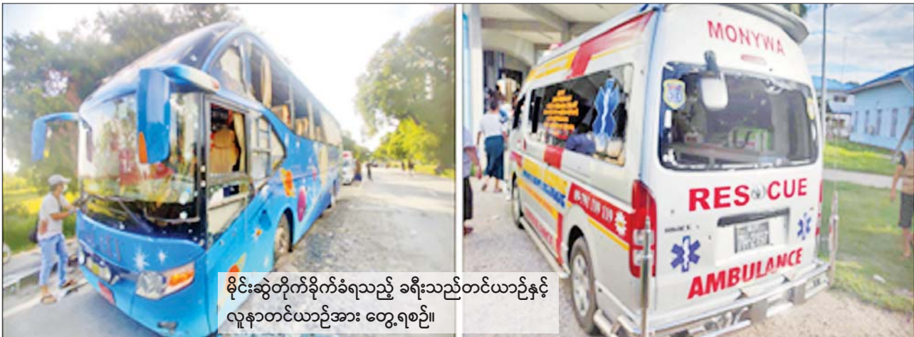
မိုင်းဆွဲတိုက်ခိုက်ခံရသည့် ခရီးသည်တင်ယာဉ်နှင့် လူနာတင်ယာဉ်အား တွေ့ရစဉ်။

နေပြည်တော် ဇူလိုင် ၁၂ နိုင်ငံရေးအစွန်းရောက် အကြမ်းဖက်အဖွဲ့များအနေဖြင့် နိုင်ငံတော် တည်ငြိမ်အေးချမ်းမှု ပျက်ပြားစေရန် ရည်ရွယ်၍ စစ်ရေးပစ်မှတ် မဟုတ်သည့် အပြစ်မဲ့ပြည်သူများ နေထိုင်ရာ မြို့၊ ကျေးရွာများ အတွင်းသို့ လက်နက်ကြီး၊ လက်နက်ငယ်များဖြင့် ပစ်ခတ်တိုက်ခိုက်ခြင်း၊ လမ်းမကြီးများပေါ်၌ မောင်းနှင်သွားလာနေသည့် မော်တော်ယာဉ်များ မိုင်းဆွဲတိုက်ခိုက်ခြင်း၊ လမ်းတံတားများ မိုင်းထောင် ဖောက်ခွဲ စာမျက်နှာ ၁၇ ကော်လံ ၁ ◆