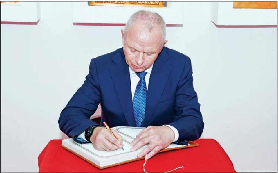
ရုရှားကာကွယ်ရေးဝန်ကြီးဌာန ဒုတိယဝန်ကြီး Colonel General Alexander Vasilievich Fomin (အလက်ဇန်းဒါး ဗာစီးလီယယ်ဗစ် ဖိုမင်) စေတီတော်ကြီး ဧည့်သည်တော်မှတ်တမ်းစာအုပ်တွင် လက်မှတ်ရေးထိုးစဉ်။

စိန်ဖူးတော်၊ ငှက်မြတ်နားတော် တင်လှူပူဇော်ပွဲနှင့် ဗုဒ္ဓဘာသာ အနေကဇာတင် မဟာမင်္ဂလာ အခမ်းအနားသို့ လာရောက်စဉ် အခွင့်ကြုံသဖြင့် သင်တန်းသားများကို တွေ့ဆုံခြင်းဖြစ်ပြီး ယခုကဲ့သို့ဗုဒ္ဓဘာသာ ထုံးတမ်းစဉ်လာ မဟာမင်္ဂလာ အခမ်းအနားကို သင်တန်းသားအရာရှိများ ကိုယ်တိုင်ကိုယ်ကျ ပါဝင်ခဲ့ကြရသဖြင့် ကုသိုလ်များစွာ ရရှိနိုင်မည်ဖြစ်ကြောင်း၊ ဗုဒ္ဓသာသနာတော်ကြီး ထွန်းကားပြန့်ပွားစေရန်နှင့် ရုရှား-မြန်မာ နှစ်နိုင်ငံ ချစ်ကြည်ရေးနှင့် ယဉ်ကျေးမှုပူးပေါင်းဆောင်ရွက်မှု၏ သမိုင်းမှတ်တိုင်တစ်ခု ဖြစ်စေရန် စေတီတော်ကြီးကို တည်ဆောက်ပူဇော်နိုင်ရေး ဆောင်ရွက်ခဲ့ခြင်းဖြစ်ကြောင်း၊ သင်တန်းသားများအနေဖြင့်လည်း ကိုးကွယ်ရာဘာသာတရားနှင့် ပတ်သက်၍ ယုံယုံကြည်ကြည်ဖြင့် လေးလေးနက်နက် ဆောင်ရွက်ကြစေလိုပြီး ဗုဒ္ဓမြတ်စွာဘုရား၏ အဆုံးအမနှင့်အညီ မေတ္တာတရား လက်ကိုင်ထား၍ မှန်မှန်ကန်ကန် ပြောဆိုနေထိုင် ဆက်ဆံကြစေလိုကြောင်း။