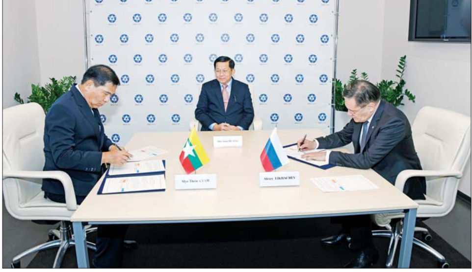
ပြည်ထောင်စုသမ္မတ မြန်မာနိုင်ငံတော် သိပ္ပံနှင့်နည်းပညာဝန်ကြီးဌာန နှင့် ရုရှားဖက်ဒရေးရှင်းနိုင်ငံ Rosatom State Corporations တို့ နားလည်မှုစာချုပ်သွား အတည်ပြုလက်မှတ်ရေးထိုးစဉ်။