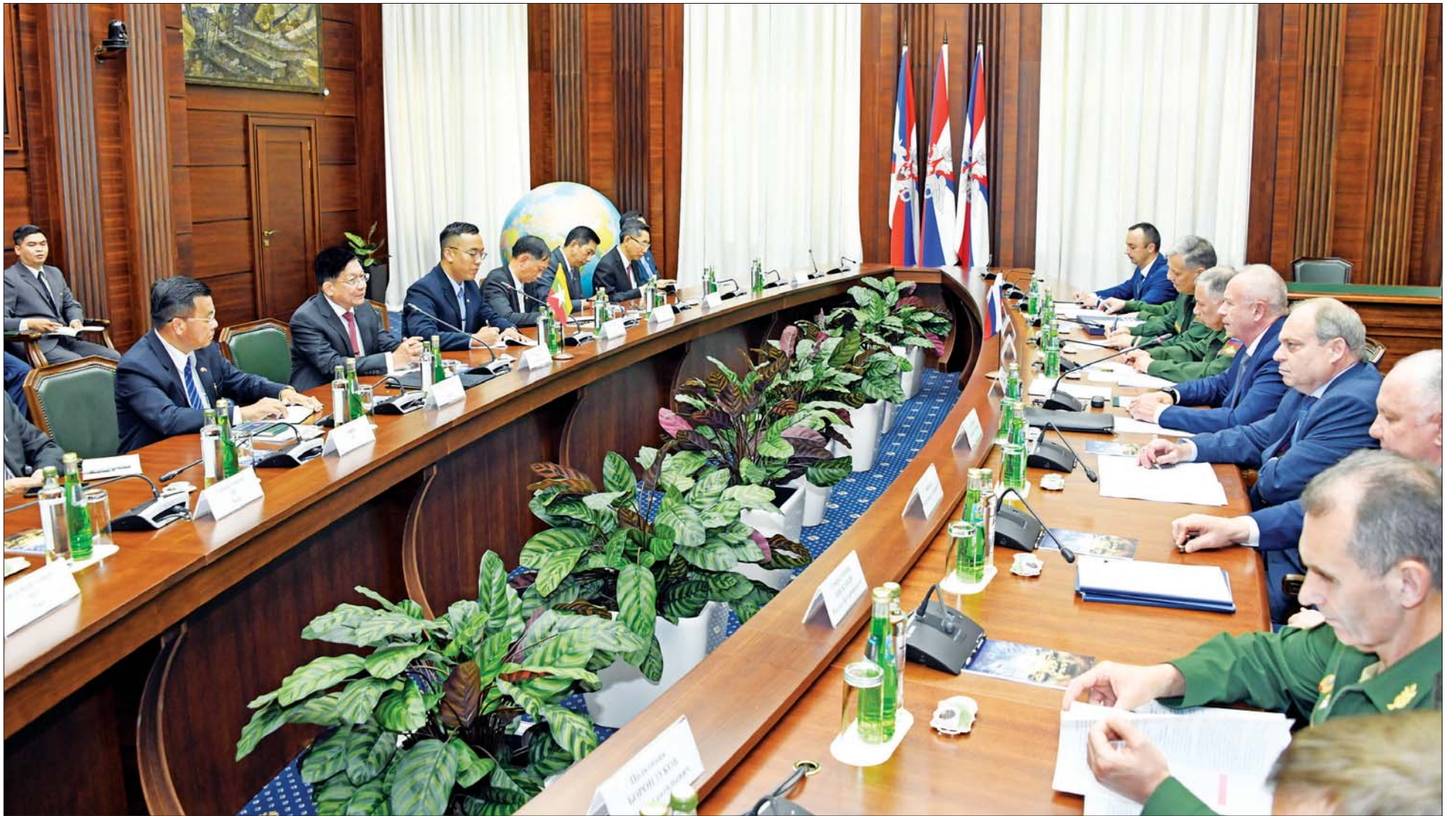
နိုင်ငံတော်စီမံအုပ်ချုပ်ရေးကောင်စီဥက္ကဋ္ဌ တပ်မတော်ကာကွယ်ရေးဦးစီးချုပ် ဗိုလ်ချုပ်မှူးကြီး မင်းအောင်လှိုင် ရုရှားဖက်ဒရေးရှင်းနိုင်ငံ ကာကွယ်ရေးဝန်ကြီးဌာနမှ တာဝန်ရှိသူအကြီးအကဲများနှင့် အလုပ်သဘော တွေ့ဆုံဆွေးနွေးစဉ်။