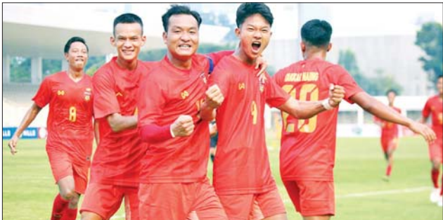
၂၀၂၂ အာဆီယံ ယူ-၁၉ ပြိုင်ပွဲ ယှဉ်ပြိုင်ခဲ့သည့် မြန်မာ ယူ-၁၉ အမျိုးသားအသင်း ကစားသမားများ။

ရန်ကုန် ဇူလိုင် ၁၂ ၂၀၂၂ အာဆီယံ ယူ-၁၉ ပြိုင်ပွဲ ယှဉ်ပြိုင်ခဲ့သည့် မြန်မာ ယူ-၁၉ အမျိုးသားအသင်းသည် ဩဂုတ် လဆန်းပိုင်းတွင် ကျင်းပမည့် ဗီယက်နမ် ယူ-၁၉ ဖိတ်ခေါ်ပြိုင်ပွဲ တွင် ဝင်ရောက်ယှဉ်ပြိုင်မည်ဖြစ် သည်။