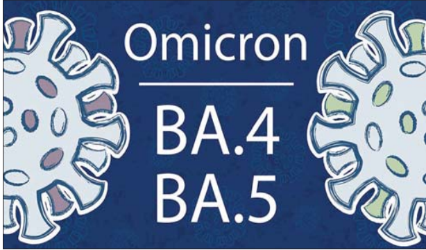
BA.5 ကူးစက်မှုအရေအတွက်နှင့် နိုင်ငံအတွင်း တွေ့ရှိသည့်နေရာကို ဖော်ပြထားခြင်းမရှိပေ။

အိုမီခရွန်မျိုးကွဲ BA.4 နှင့် BA.5 သည် ဖျားခြင်း၊ ချောင်းဆိုးခြင်း၊ လည်ချောင်းနာခြင်းနှင့် တုပ်ကွေးဖြစ်ပွားခြင်းကဲ့သို့ အခြားသော ဗီဇပြောင်းအိုမီခရွန်မျိုးကွဲများ၏ လက္ခဏာနှင့် ဆင်တူကြောင်း သိရသည်။ ကမ္ဘောဒီးယားနိုင်ငံသည် အဆိုပါထုတ်ပြန်ချက်၌ BA.4 နှင့်