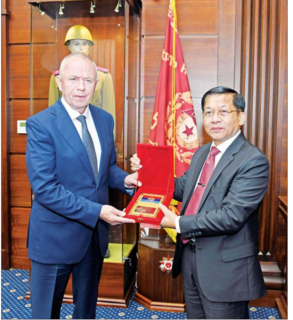
နိုင်ငံတော်စီမံအုပ်ချုပ်ရေးကောင်စီဥက္ကဋ္ဌ တပ်မတော်ကာကွယ်ရေးဦးစီးချုပ် ဗိုလ်ချုပ်မှူးကြီး မင်းအောင်လှိုင်နှင့် ရုရှားဖက်ဒရေးရှင်းနိုင်ငံ ကာကွယ်ရေးဝန်ကြီးဌာနမှ တာဝန်ရှိသူအကြီးအကဲတို့ အထိမ်းအမှတ်တံဆိပ်နှင့် အမှတ်တရလက်ဆောင်ပစ္စည်းများ အပြန်အလှန်ပေးအပ်စဉ်။