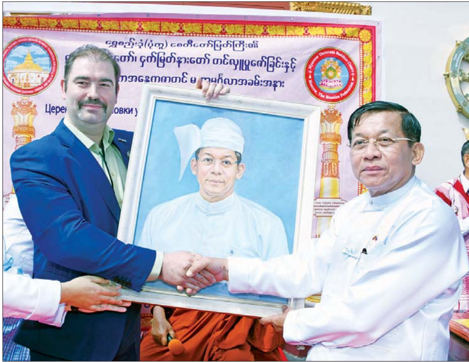
နိုင်ငံတော်စီမံအုပ်ချုပ်ရေးကောင်စီဥက္ကဋ္ဌ နိုင်ငံတော်ဝန်ကြီးချုပ် ဗိုလ်ချုပ်မှူးကြီး မင်းအောင်လှိုင်အား ရုရှားရှုခင်းပန်းချီပညာရှင် Mr. Alexander Alexandrovich Shilov က ၎င်းကိုယ်တိုင် ရေးဆွဲထားသည့် နိုင်ငံတော်စီမံအုပ်ချုပ်ရေးကောင်စီဥက္ကဋ္ဌ နိုင်ငံတော်ဝန်ကြီးချုပ်၏ ပုံတူပန်းချီကားချပ်ကို အမှတ်တရ လက်ဆောင်အဖြစ် ပေးအပ်စဉ်။