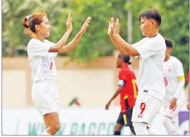
မြန်မာအမျိုးသမီးအသင်း။

ရန်ကုန် ဇူလိုင် ၁၂ ၂၀၂၂ အာဆီယံ အမျိုးသမီး ချန်ပီယံရှစ်ပြိုင်ပွဲ အုပ်စု (ခ) နောက်ဆုံးနေ့ကို ဇူလိုင် ၁၃ ရက် (ယနေ့) တွင် ဖိလစ်ပိုင်နိုင်ငံ၌ ဆက်လက် ကျင်းပမည်ဖြစ်ပြီး အုပ်စုပထမနေရာအတွက် မြန်မာ နှင့် ဗီယက်နမ်အသင်းတို့ အဆုံးအဖြတ်ပွဲကစားရမည် ဖြစ်သည်။ အုပ်စု (ခ) နောက်ဆုံးနေ့အဖြစ် ယနေ့ မြန်မာတော်ချန် ညနေ ၅ နာရီခွဲတွင် မြန်မာနှင့် ဗီယက်နမ် စာမျက်နှာ ၁၄ ကော်လံ ၁ ●