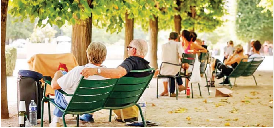
အပူဒဏ်ကာကွယ်ရန် အရိပ်ရအပင်အောက်၌ ပြည်သူများ အနားယူနေကြစဉ်။