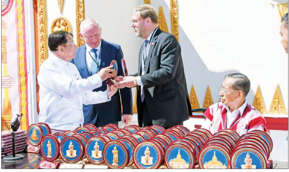
နိုင်ငံတော်စီမံအုပ်ချုပ်ရေးကောင်စီဥက္ကဋ္ဌ နိုင်ငံတော်ဝန်ကြီးချုပ် ဗိုလ်ချုပ်မှူးကြီး မင်းအောင်လှိုင် အခမ်းအနား တက်ရောက်လာကြသူများအား ဓမ္မလက်ဆောင်များ ပေးအပ်စဉ်။