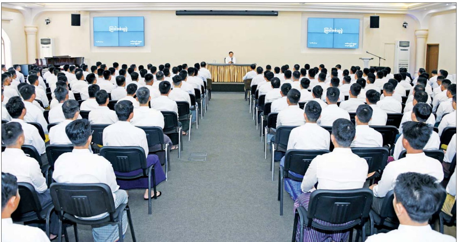
နိုင်ငံတော်စီမံအုပ်ချုပ်ရေးကောင်စီဥက္ကဋ္ဌ နိုင်ငံတော်ဝန်ကြီးချုပ် ဗိုလ်ချုပ်မှူးကြီး မင်းအောင်လှိုင် ရုရှားဖက်ဒရေးရှင်းနိုင်ငံရှိ မြန်မာ့တပ်မတော်မှ ပညာတော်သင် သင်တန်းသားအရာရှိများအား တွေ့ဆုံအမှာစကားပြောကြားစဉ်။

လက်တစ်လုံးခြား အသုံးပြုခြင်းများ လုပ်ဆောင်လာခဲ့သည်ကို တွေ့ခဲ့ရကြောင်း၊ ထို့နောက် ရွေးကောက်ပွဲမတိုင်မီ လှုပ်ရှားမှုများနှင့် ရွေးကောက်ပွဲ ကျင်းပပြုလုပ်ချိန်တို့တွင်လည်း မသမာသော နည်းလမ်းများဖြင့် အနိုင်ရရှိနိုင်ရေး လုပ်ဆောင်လာခဲ့သည်ကို တွေ့ရှိခဲ့ရကြောင်း၊ ထို့နောက် မဲမသမာမှုများကို ရှင်းလင်းဆောင်ရွက်ပေးရန် တပ်မတော်က တာဝန်ရှိသူအစိုးရအဖွဲ့သို့ ပြောကြားခဲ့သော်လည်း ဖြေရှင်းဆောင်ရွက်ပေးခြင်းမရှိသည့်အပြင် နိုင်ငံတော်၏ အာဏာကို အတင်းအဓမ္မရယူရန် ကြိုးပမ်းလာခဲ့သောကြောင့် တပ်မတော်မှ နိုင်ငံတော်၏ တာဝန်များကို ဝင်ရောက်ထိန်းသိမ်းဆောင်ရွက်ခဲ့ရခြင်းဖြစ်ကြောင်း၊ ထိုသို့ ဆောင်ရွက်ခဲ့ခြင်းသည် နိုင်ငံတော်လျှောက်လှမ်းနေသည့် ပါတီစုံဒီမိုကရေစီလမ်းကြောင်း ခိုင်မာရေးအတွက်သာဖြစ်ပြီး ထိုလမ်းကြောင်းပေါ်မှ သွေဖည်စေမည် မဟုတ်ကြောင်း၊ တပ်မတော်အနေဖြင့် စစ်မှန်စည်းကမ်းပြည့်ဝသည့် ပါတီစုံဒီမိုကရေစီစနစ် ခိုင်မာစေရေး၊ ဒီမိုကရေစီနှင့် ဖက်ဒရယ်စနစ်ကို အခြေခံသည့် ပြည်ထောင်စုတည်ဆောက်ရေးကို ဦးတည်ဆောင်ရွက်လျက်ရှိကြောင်း၊ သင်တန်းသား အရာရှိများအနေဖြင့် နိုင်ငံတော်၏ နိုင်ငံရေးဖြစ်ပေါ်ပြောင်းလဲမှုကို မှန်မှန်ကန်ကန်သိရှိနိုင်ရန်အတွက် ယခုကဲ့သို့ သမိုင်းဖြစ်စဉ်ဖြစ်ရပ်များနှင့်တကွ အကျယ်တဝင့် ရှင်းလင်းပြောကြားခြင်းဖြစ်ကြောင်း။