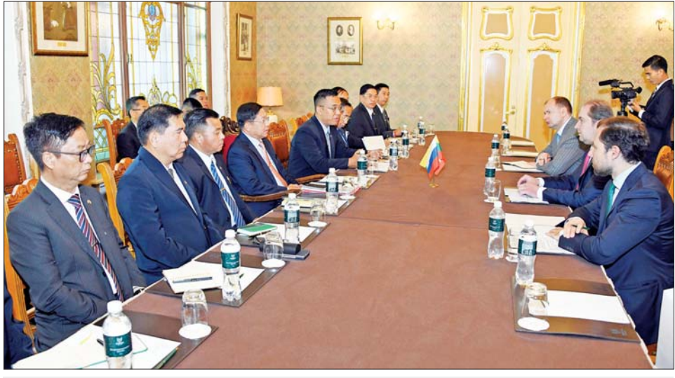
နိုင်ငံတော်စီမံအုပ်ချုပ်ရေးကောင်စီဥက္ကဋ္ဌ နိုင်ငံတော်ဝန်ကြီးချုပ် ဗိုလ်ချုပ်မှူးကြီး မင်းအောင်လှိုင် ရုရှား - အာဆီယံ စီးပွားရေးကောင်စီဥက္ကဋ္ဌ Mr. Ivan Polyakov နှင့် တွေ့ဆုံဆွေးနွေးစဉ်။