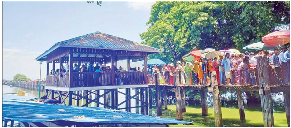
အမရပူရမြို့နယ်ရှိ ဦးပိန်တံတား၌ လာရောက်အပန်းဖြေသူများဖြင့် စည်ကားနေသည်ကို တွေ့ရစဉ်။