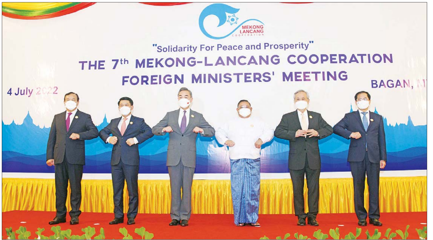
မဲခေါင် - လန်ချန်း ပူးပေါင်းဆောင်ရွက်မှု အဖွဲ့ဝင်နိုင်ငံများမှ နိုင်ငံခြားရေးဝန်ကြီးများ စုပေါင်းမှတ်တမ်းတင်ဓာတ်ပုံ ရိုက်စဉ်။

ပူးပေါင်းဆောင်ရွက်သွားရန်လို နိုင်ငံခြားရေးဝန်ကြီးဌာန ပြည်ထောင်စုဝန်ကြီး က မိန့်ခွန်းပြောကြားရာတွင် ယခုကျင်းပသည့် အစည်းအဝေး၏ခေါင်းစဉ်မှာ “စည်းလုံးညီညွတ်မှုမှ သည် ငြိမ်းချမ်းရေးနှင့် သာယာဝပြောမှုဆီသို့” (Solidarity for Peace and Prosperity) ဖြစ်သည် နှင့်အညီ လက်ရှိနှင့် အနာဂတ်စိန်ခေါ်မှုများကို စည်းလုံးညီညွတ်မှုအခြေခံသည့် စုပေါင်းအားဖြင့် ဖြေရှင်းဆောင်ရွက်ရန် လိုအပ်ကြောင်း၊ ဒေသတွင်း ကျန်းမာရေးလိုခြုံမှုကဏ္ဍတွင် ကိုဗစ်-၁၉ အပါအဝင် ကူးစက်ရောဂါများ ကာကွယ်ထိန်းချုပ်ရေးအတွက် နီးကပ်စွာ ပူးပေါင်းဆောင်ရွက်သွားရန် လိုအပ်ကြောင်း၊ တရုတ်နိုင်ငံမှ မြန်မာနိုင်ငံသို့ ကိုဗစ်-၁၉ တိုက်ဖျက် ရေးနှင့်ပတ်သက်၍ ကူညီထောက်ပံ့မှုများအတွက် ကျေးဇူးတင်ရှိကြောင်း ပြောကြားသည်။