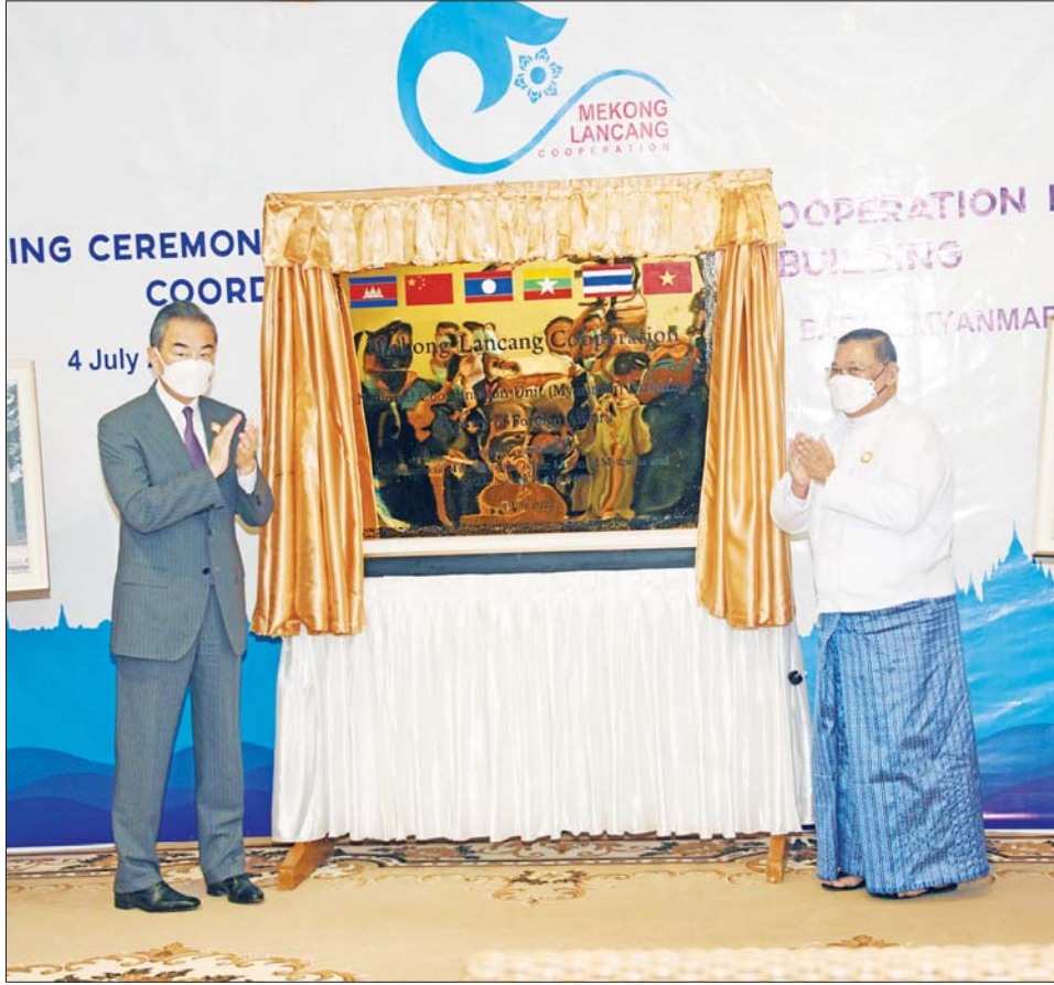
မဲခေါင်-လန်ချန်းပူးပေါင်းဆောင်ရွက်မှု ပူးပေါင်းညှိနှိုင်းရေးအဖွဲ့ (မြန်မာ)အဆောက်အအုံဖွင့်ပွဲ ပြုလုပ်စဉ်။

ထို့အပြင် စီးပွားရေးပြန်လည်နာလန်ထူရေး အတွက် ဦးစားပေးပူးပေါင်းဆောင်ရွက်သွားရန်နှင့် လက်ရှိကြုံတွေ့နေရသည့် စိန်ခေါ်မှုများကို ထိရောက် စွာ တုံ့ပြန်နိုင်မည့်ဟု ယူဆသည့်အတွက် တရုတ် နိုင်ငံ၏ “ကမ္ဘာလုံးဆိုင်ရာ ဖွံ့ဖြိုးတိုးတက်မှုလုပ်ငန်း စဉ်” (Global Development Initiative)ကို ကြိုဆို ထောက်ခံပါကြောင်း၊ ဒေသတွင်း ငြိမ်းချမ်းမှုနှင့် တည်ငြိမ်မှုမရှိလျှင် ဒေသတွင်း ဖွံ့ဖြိုးတိုးတက်မှု ရရှိနိုင်မည် မဟုတ်သည့်အတွက် တရုတ်နိုင်ငံ၏ “ကမ္ဘာလုံးဆိုင်ရာ လုံခြုံရေးလုပ်ငန်းစဉ် (Global Security Initiative)”ကို ထောက်ခံပါကြောင်းလည်း ထည့်သွင်းပြောကြားသည်။