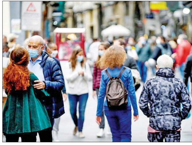
ဒိန်းမတ်နိုင်ငံ၌ ပါးစပ်နှာခေါင်းစည်းတပ်ဆင်၍ သွားလာနေကြသူများကို တွေ့ရစဉ်။

(ဒဗလျူအိတ်ချ်အို) က ထုတ်ပြန်သော အချက်အလက်အရ သိရ သည်။ ဆင်ဟွာ