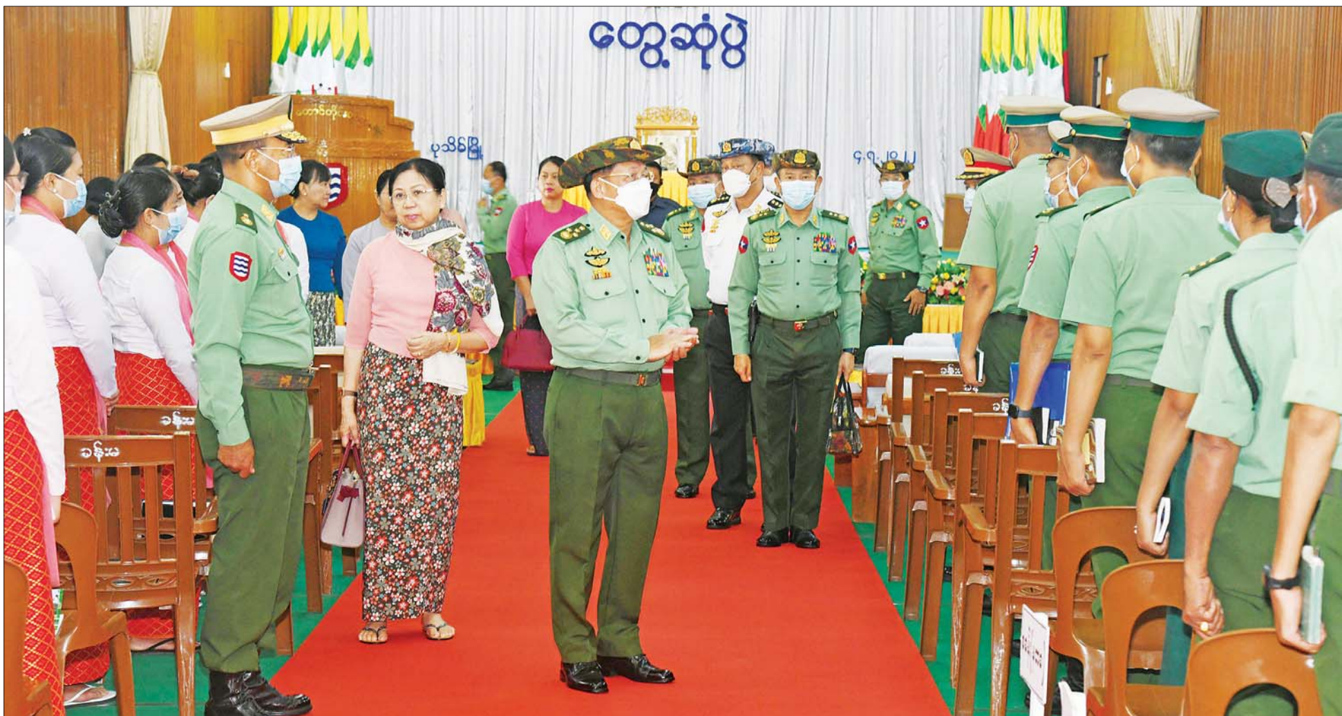
နိုင်ငံတော်စီမံအုပ်ချုပ်ရေးကောင်စီဥက္ကဋ္ဌ တပ်မတော်ကာကွယ်ရေးဦးစီးချုပ် ဗိုလ်ချုပ်မှူးကြီး မင်းအောင်လှိုင် အနောက်တောင်တိုင်းစစ်ဌာနချုပ်၊ ပုသိမ်တပ်နယ်မှ အရာရှိ၊ စစ်သည်၊ မိသားစုများအား ရင်းရင်းနှီးနှီး နှုတ်ဆက်စဉ်။

၄။ တစ်နိုင်ငံလုံး ထာဝရငြိမ်းချမ်းရေးရရှိရေးအတွက် တစ်နိုင်ငံလုံး ပစ်ခတ်တိုက်ခိုက်မှုရပ်စဲရေး သဘောတူစာချုပ် (NCA) ပါ သဘောတူညီချက်များအတိုင်း ဖြစ်နိုင်သမျှ အလေးထား လုပ်ဆောင်သွားမည်။ ၅။ အရေးပေါ်ကာလဆိုင်ရာ ပြဋ္ဌာန်းချက်များနှင့်အညီ ဆောင်ရွက်ပြီးစီးပါက ဖွဲ့စည်းပုံအခြေခံဥပဒေ (၂၀၀၈ ခုနှစ်)နှင့်အညီ လွတ်လပ်ပြီး တရားမျှတသော ပါတီစုံဒီမိုကရေစီ အထွေထွေရွေးကောက်ပွဲအား ပြန်လည်ကျင်းပ၍ အနိုင်ရသည့်ပါတီအား ဒီမိုကရေစီစံနှုန်းများနှင့်အညီ နိုင်ငံတော်တာဝန်အား လွှဲအပ်နိုင်ရေး ဆက်လက်ဆောင်ရွက်သွားမည်။