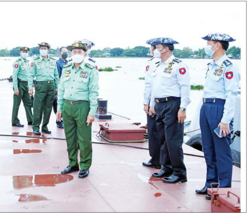
နိုင်ငံတော်စီမံအုပ်ချုပ်ရေးကောင်စီဥက္ကဋ္ဌ တပ်မတော်ကာကွယ်ရေးဦးစီးချုပ် ဗိုလ်ချုပ်မှူးကြီး မင်းအောင်လှိုင်နှင့်အဖွဲ့ဝင်များ ပုသိမ်မြို့ အမှတ် (၁) ရပ်ကွက် ကမ်းနားလမ်းတွင် မြစ်ကြမ်းခင်းမြေသားစွမ်းအင် မြှင့်တင်ခြင်းလုပ်ငန်း ဆောင်ရွက်နေမှုအခြေအနေများကို ကြည့်ရှုစစ်ဆေးစဉ်။