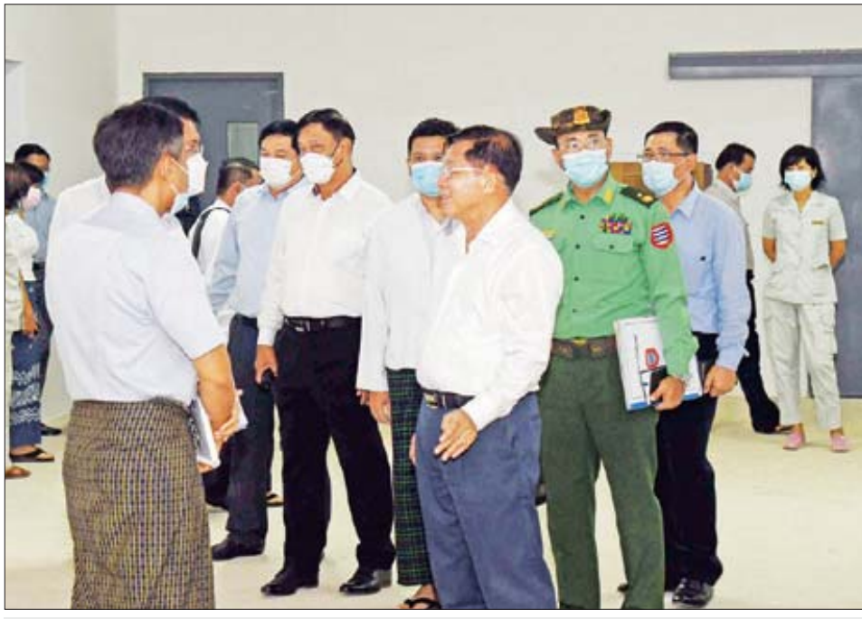
နိုင်ငံတော်စီမံအုပ်ချုပ်ရေးကောင်စီဥက္ကဋ္ဌ နိုင်ငံတော်ဝန်ကြီးချုပ် ဗိုလ်ချုပ်မှူးကြီး မင်းအောင်လှိုင် နှင့် အဖွဲ့ဝင်များ ပုသိမ်ပြည်သူ့ဆေးရုံကြီး (၉)ထပ် တိုးချဲ့ဆောင် ဆောက်လုပ်ခြင်းလုပ်ငန်းခွင်အတွင်း ကြည့်ရှုစစ်ဆေးစဉ်။

စာမျက်နှာ ၅ မှ ကုန်ထုတ်လုပ်ငန်းကို အားပေးဆောင်ရွက်၍မရဘဲ မိမိတို့တတ်ကျွမ်းသည့် ပညာရပ်များကို အသုံးပြု၍ စိုက်ပျိုးမွေးမြူရေးကိုအခြေခံသည့် ထုတ်ကုန် ထုတ်လုပ်ခြင်းများဆောင်ရွက်ရမည် ဖြစ်ကြောင်း၊ စီမံခန့်ခွဲမှုလုပ်ငန်းများ အဆင်ပြေချောမွေ့စေရန်နှင့် ဖွံ့ဖြိုးတိုးတက်ရေးလုပ်ငန်းများကို ပိုမိုလျင်မြန် ချောမွေ့စွာ ဆောင်ရွက်နိုင်စေရန်အတွက် ခရိုင်များ တိုးချဲ့ဖွဲ့စည်းခဲ့ကြောင်း၊ ခရိုင်အဆင့်ကို အခြေခံ၍ တစ်နိုင်လုံးအုပ်ချုပ်မှုကို ပိုမိုအဆင်ပြေအောင် ဆောင်ရွက်နိုင်မည်ဖြစ်ကြောင်း။