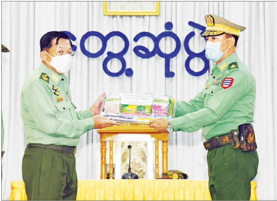
နိုင်ငံတော်စီမံအုပ်ချုပ်ရေးကောင်စီဥက္ကဋ္ဌ တပ်မတော်ကာကွယ်ရေးဦးစီးချုပ် ဗိုလ်ချုပ်မှူးကြီး မင်းအောင်လှိုင် အရာရှိ စစ်သည်၊ မိသားစုများအတွက် စားသောက်ဖွယ်ရာပစ္စည်းများ ပေးအပ်စဉ်။