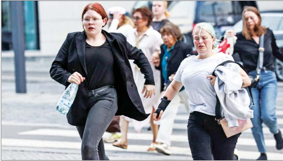
သေနတ်ပစ်ခတ်မှုဖြစ်ပွားပြီးနောက် ပြည်သူများ အထိတ်တလန့်ပြေးလွှားနေကြသည်ကို တွေ့ရစဉ်။

ကိုပင်ဟေဂင် ဇူလိုင် ၄ ဒိန်းမတ်နိုင်ငံ မြို့တော်ကိုပင် ဟေဂင်ရှိ ဈေးဝယ်စင်တာတစ်ခု တွင် ဇူလိုင် ၃ ရက်က သေနတ် ပစ်ခတ်မှုဖြစ်ပွားပြီး သုံးဦးထက် မနည်း သေဆုံးကာ အများအပြား ထိခိုက်ဒဏ်ရာ ရရှိခဲ့ကြောင်း အင်န်အိတ်ချ်ကေ သတင်းတစ်ရပ် ၏ ဖော်ပြချက်အရ သိရသည်။ ရဲတပ်ဖွဲ့သည် အဆိုပါ ပစ်ခတ်မှုနှင့်ပတ်သက်ပြီး သတင်း ရရှိပြီးနောက် အခင်းဖြစ်ပွားရာ နေရာသို့ ချက်ချင်းသွားရောက်ခဲ့ ကြောင်း၊ သေနတ်ပစ်ခတ်မှု ဖြစ်ပွားရာနေရာမှ သံသယရှိသူ အသက် ၂၂ နှစ် အရွယ် ဒိန်းမတ် နိုင်ငံသား တစ်ဦးကို ဖမ်းဆီးရမိခဲ့ ကြောင်း သိရသည်။ ထိခိုက်ဒဏ်ရာရသည့် သုံးဦး သည် စိုးရိမ်ရသည့် အခြေအနေ