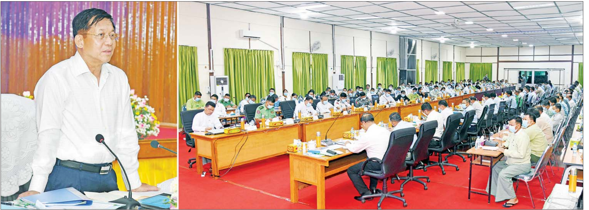
နိုင်ငံတော်စီမံအုပ်ချုပ်ရေးကောင်စီဥက္ကဋ္ဌ နိုင်ငံတော်ဝန်ကြီးချုပ် ဗိုလ်ချုပ်မှူးကြီး မင်းအောင်လှိုင် ဧရာဝတီတိုင်းဒေသကြီးရှိ တိုင်းဒေသကြီး၊ ခရိုင်၊ မြို့နယ်အဆင့် ဌာနဆိုင်ရာဝန်ထမ်းများအား တွေ့ဆုံအမှာစကား ပြောကြားစဉ်။