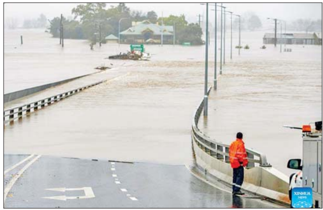
နယူးဆော့ဝေးလ်ပြည်နယ် လမ်းမကြီးတစ်ခု၌ ရေကြီးရေလျှံမှု ဖြစ်ပွားနေသည်ကို တွေ့ရစဉ်။

နေထိုင်သူများအနေဖြင့် နိုင်ငံတော် အရေးပေါ်အခြေအနေ ဆိုင်ရာ ဝန်ဆောင်မှုဌာန၏ ဘေးလွတ်ရာ သို့ ရွှေ့ပြောင်းရန် သတိပေးချက် ရရှိပါက ဘေးလွတ်ရာသို့ ထွက်ခွာရန် အသင့်ပြင်ထား ရန်နှင့် ရွှေ့ပြောင်းရန် ညွှန်ကြား ချက်ရရှိပါက ချက်ချင်းထွက်ခွာ နိုင်ရေး အရေးပေါ်ညွှန်ကြားချက် များကို လိုက်နာကြရန် တိုက်တွန်း ပြောကြားသည်။ နယူးဆော့ဝေးလ် ပြည်နယ် အတွင်း နိုင်ငံတော်အရေးပေါ် အခြေအနေဆိုင်ရာ ဝန်ဆောင်မှု ဌာနသို့ ဇူလိုင် ၃ ရက်ညပိုင်းမှ ဇူလိုင် ၄ ရက် နံနက်ပိုင်းအထိ အရေးပေါ်အကူအညီတောင်းခံမှု ၁၅၉၃ ကြိမ်ရှိခဲ့ပြီး ရေဘေး ကယ်ဆယ်ရေးလုပ်ငန်း ၈၃ ကြိမ် လုပ်ဆောင်ခဲ့ကြောင်း ပြည်နယ် ဝန်ကြီးချုပ်က ဆိုသည်။ ပြည်နယ် တစ်ဝန်းနှင့် ဆစ်ဒနီမြို့အနီးရှိ လူဦးရေ ၃၂၀၀၀ ကိုဘေးလွတ်ရာ ရွှေ့ပြောင်းပေးရန် အရေးပေါ် ကယ်ဆယ်ရေး ညွှန်ကြားမှုများ ဆောင်ရွက်လျက်ရှိသည်။ ထို့ အတူ ပြည်နယ်အတွင်းရှိ ရေကြီး ရေလျှံမှု အဆိုးရွားဆုံးခံစားရသည့် နေရာများတွင် အရေးပေါ် ကယ်ဆယ်ရေးစင်တာ ခုနစ်ခု ဖွင့်လှစ်ပြီး ကယ်ဆယ်ရေး လုပ်ငန်းများ ဆောင်ရွက်လျက်ရှိ သည်။ ဇူလိုင် ၅ ရက်အထိ မိုးသည်းထန်စွာ ရွာသွန်းမှုနှင့် လေပြင်းမုန်တိုင်း တိုက်ခတ်မှုများ ဆက်လက်ကြုံတွေ့ရနိုင်ကြောင်း၊ ပြည်နယ်တစ်ဝန်း မိုးရေချိန် ၅၀ မှ ၁၀၀ မီလီမီတာအထိ ထပ်မံ ရွာသွန်းနိုင်ပြီး လျှပ်တစ်ပြက် ရေကြီး ရေလျှံမှုများ ဖြစ်ပေါ်လာ နိုင်ကြောင်း မိုးလေဝသဌာနက သတိပေးထားသည်။ ဆင်ဟွာ