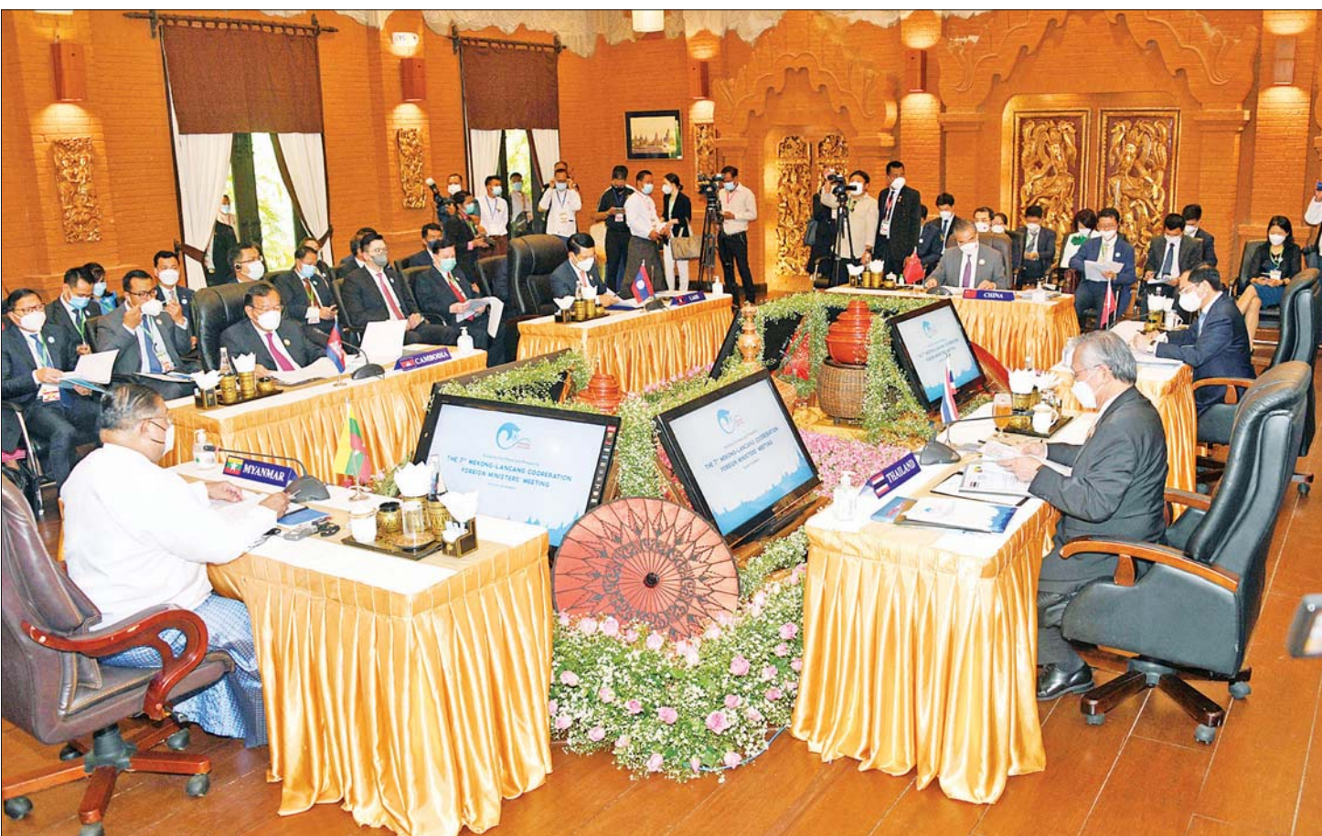
နေပြည်တော် ဇူလိုင် ၄

(၇) ကြိမ်မြောက် မဲခေါင်-လန်ချန်း ပူးပေါင်း ဆောင်ရွက်မှု နိုင်ငံခြားရေးဝန်ကြီးများ အစည်းအဝေးကို ယနေ့ နံနက်ပိုင်းတွင် ပုဂံမြို့ရှိ ရွှေနန်းတော် ဟိုတယ်၌ မြန်မာနိုင်ငံက အိမ်ရှင်အဖြစ် လက်ခံ ကျင်းပသည်။ (ဝဲပုံ)