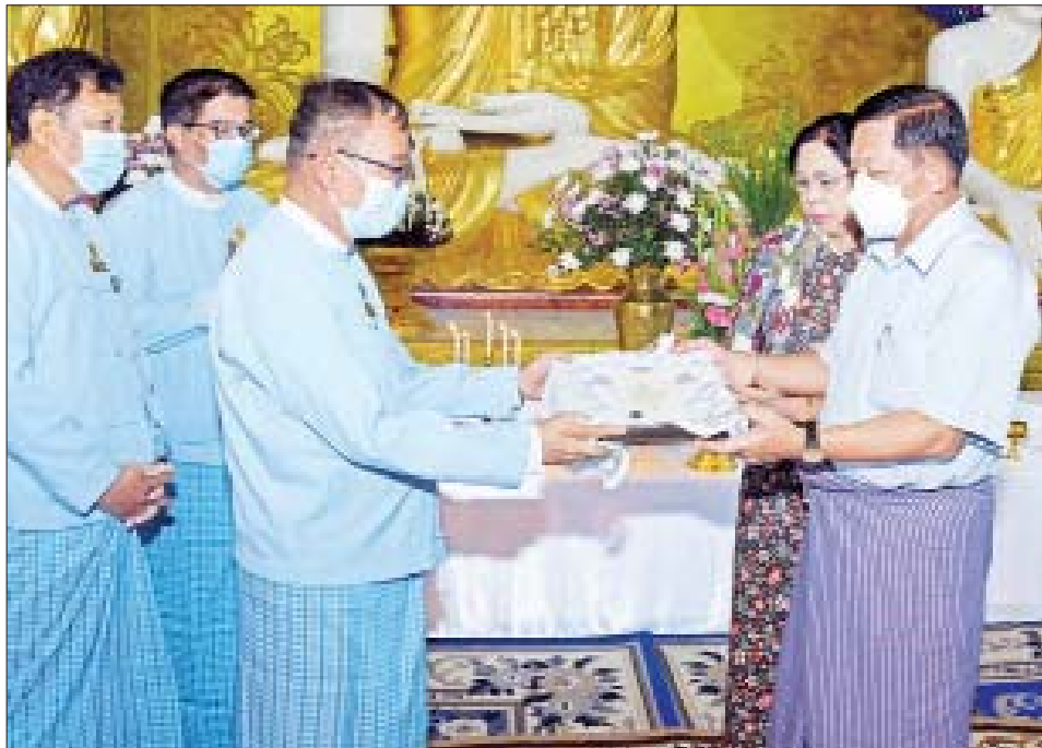
နိုင်ငံတော်စီမံအုပ်ချုပ်ရေးကောင်စီဥက္ကဋ္ဌ နိုင်ငံတော်ဝန်ကြီးချုပ် ဗိုလ်ချုပ်မှူးကြီး မင်းအောင်လှိုင်နှင့် ဇနီး ဒေါ်ကြူကြူလှ ရွှေမုဋ္ဌော မဟာစေတီတော်မြတ်ကြီးအတွက် အလှူငွေများ ပေးအပ်လှူဒါန်းစဉ်။