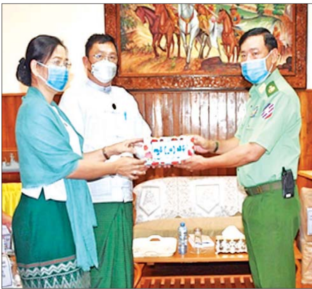
စုစုပေါင်းတန်ဖိုး ငွေကျပ် ၁၁၂ ပြည်နယ်ပြည်ထောင်စုကြံ့ခိုင်ရေး သိန်းကျော်ကို လည်းကောင်း၊ နှင့် ဖွံ့ဖြိုးရေးအသင်း၊ ကရင် ပြည်နယ် ဗုဒ္ဓဘာသာ ကလောင်

နေပြည်တော် ဇူလိုင် ၄ ကရင်ပြည်နယ် မြဝတီမြို့နယ် ဝေါလေဒေသအတွင်း လုံခြုံရေး တာဝန်များ ထမ်းဆောင်လျက်ရှိ သည့် တပ်မတော်သားများ အတွက် ဂုဏ်ပြုချီးမြှင့်ငွေနှင့် စားသောက်ဖွယ်ရာများကို မွန် ပြည်နယ်နှင့် ကရင်ပြည်နယ် အစိုးရအဖွဲ့ တို့မှ တာဝန်ရှိသူများ၊ စေတနာရှင် အလှူရှင်များက အရှေ့တောင်တိုင်းစစ်ဌာနချုပ်သို့ လာရောက် လှူဒါန်းကြသည်။ ထိုသို့လှူဒါန်းရာတွင် မွန် ပြည်နယ်အစိုးရအဖွဲ့နှင့် တပ်မ တော် ချစ်မြတ်နိုးသူ စေတနာရှင် အဖွဲ့တို့က ဂုဏ်ပြုချီးမြှင့်ငွေနှင့် စားသောက်ဖွယ်ရာ ၁၁ မျိုး၊