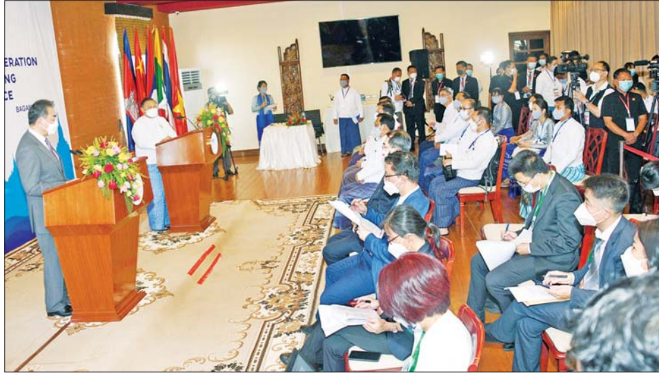
မဲခေါင် - လန်ချန်းပူးပေါင်းဆောင်ရွက်မှု ပူးတွဲဥက္ကဋ္ဌများဖြစ်သည့် မြန်မာနှင့် တရုတ်နိုင်ငံခြားရေးဝန်ကြီးများ ပူးတွဲသတင်းစာရှင်းလင်းပွဲ ပြုလုပ်စဉ်။

လန်ချန်းပူးပေါင်းဆောင်ရွက်မှုသဘာဝဘေးအန္တရာယ် စီမံခန့်ခွဲမှုလုပ်ငန်းစဉ်” ထူထောင်ရန်ကိုလည်း ကြိုဆို ကြောင်း ဆွေးနွေးခဲ့သည်။ ရေအရင်းအမြစ်၊ စိုက်ပျိုးရေး၊ စက်မှုကုန်ထုတ် လုပ်မှုစွမ်းရည်တိုးမြှင့်မှု၊ လျှပ်စစ်ဓာတ်အား ထုတ်လုပ်မှုနှင့် ပြည့်ဖြိုးမြဲစွမ်းအင် အပါအဝင် အခြားပူးပေါင်း ဆောင်ရွက်မှုကဏ္ဍများ၌ ပူးပေါင်း ဆောင်ရွက်နိုင်မည့် အခြေအနေများကိုလည်း ပြည်ထောင်စုဝန်ကြီးက ဆွေးနွေးခဲ့သည်။ မဟာဗျူဟာမြောက်ဦးဆောင်မှုကို တိုးမြှင့် ပူးတွဲဥက္ကဋ္ဌ တရုတ်နိုင်ငံတော်ကောင်စီဝင်နှင့် နိုင်ငံခြားရေးဝန်ကြီး ဝမ်ယိက မိန့်ခွန်းပြောကြား ရာတွင် မဲခေါင်-လန်ချန်းပူးပေါင်းဆောင်ရွက်မှု မူဘောင်အောက်မှ ဆက်လက်ဆောင်ရွက်သွားမည့် လုပ်ငန်းစဉ်များဖြစ်သည့် စဉ်ဆက်မပြတ်ဖွံ့ဖြိုးတိုး တက်မှုအတွက် မဟာဗျူဟာမြောက်ဦးဆောင်မှုကို တိုးမြှင့်သွားရေး၊ စီးပွားရေးပူးပေါင်းဆောင်ရွက်မှု ကို ပိုမိုမြှင့်တင်သွားရေး၊ စိုက်ပျိုးရေးကဏ္ဍတွင် ပူးပေါင်းဆောင်ရွက်မှု တိုးချဲ့သွားရေး၊ အစိမ်းရောင် ကဏ္ဍ ဖွံ့ဖြိုးတိုးတက်မှုမြှင့်တင်ဆောင်ရွက်သွားရေး၊ ဒစ်ဂျစ်တယ်ဆန်းသစ်တီထွင်မှုကဏ္ဍတွင် ပူးပေါင်း ဆောင်ရွက်မှုတိုးမြှင့်ရေးနှင့် ပြည်သူ့အချင်းချင်း ထိတွေ့ဆက်ဆံမှု တိုးမြှင့်သွားရေးတို့အပေါ် ဆွေးနွေး ခဲ့သည်။