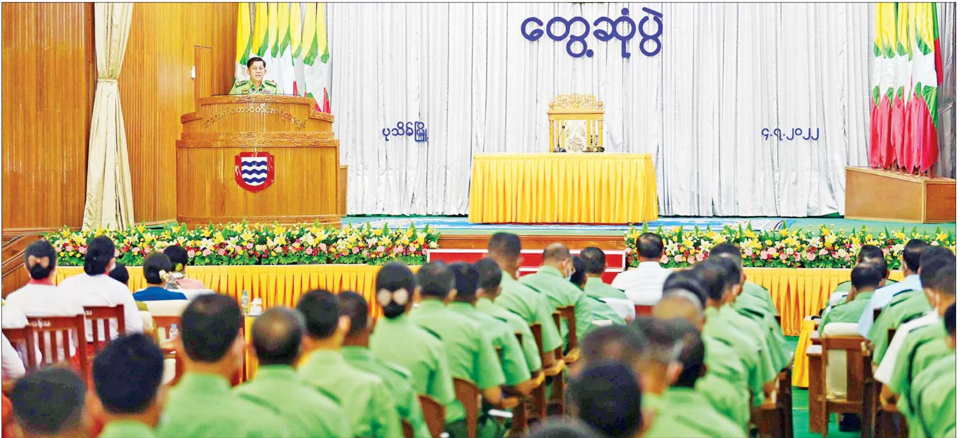
နိုင်ငံတော်စီမံအုပ်ချုပ်ရေးကောင်စီဥက္ကဋ္ဌ တပ်မတော်ကာကွယ်ရေးဦးစီးချုပ် ဗိုလ်ချုပ်မှူးကြီး မင်းအောင်လှိုင် အနောက်တောင်တိုင်းစစ်ဌာနချုပ်၊ ပုသိမ်တပ်နယ်မှ အရာရှိ၊ စစ်သည်၊ မိသားစုများအား တွေ့ဆုံအမှာစကားပြောကြားစဉ်။