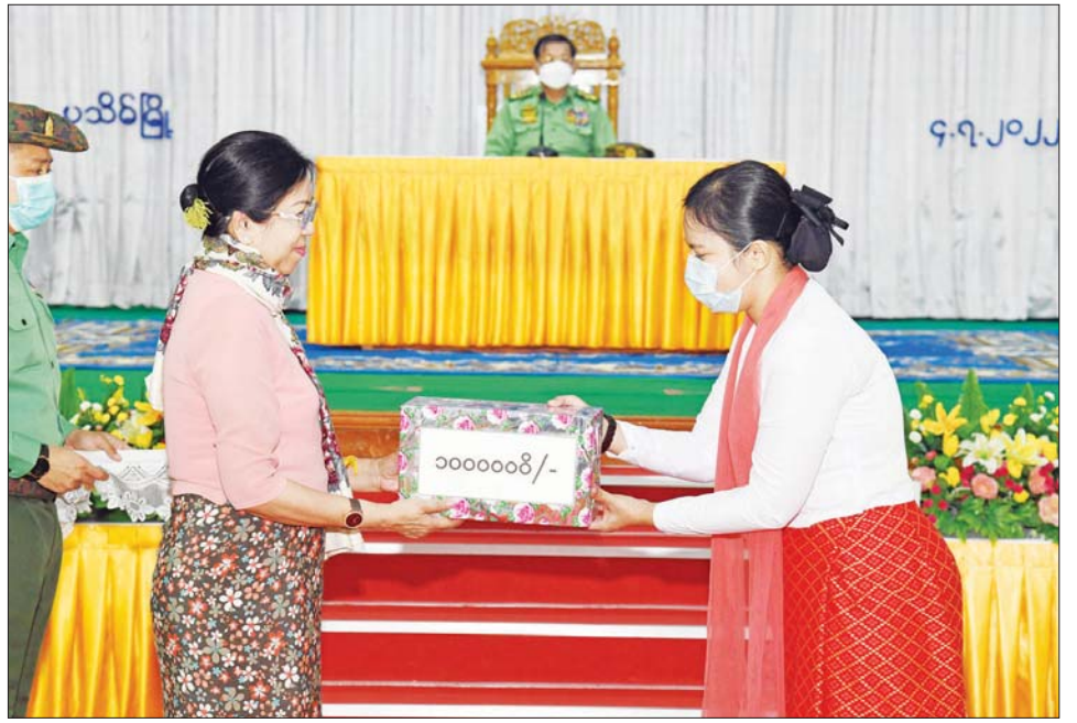
နိုင်ငံတော်စီမံအုပ်ချုပ်ရေးကောင်စီဥက္ကဋ္ဌ တပ်မတော်ကာကွယ်ရေးဦးစီးချုပ် ဗိုလ်ချုပ်မှူးကြီး မင်းအောင်လှိုင်၏ဇနီး ဒေါ်ကြူကြူလှ တပ်နယ် မိခင်နှင့် ကလေးစောင့်ရှောက်ရေးအသင်းအတွက် ချီးမြှင့်ငွေများ ပေးအပ်စဉ်။