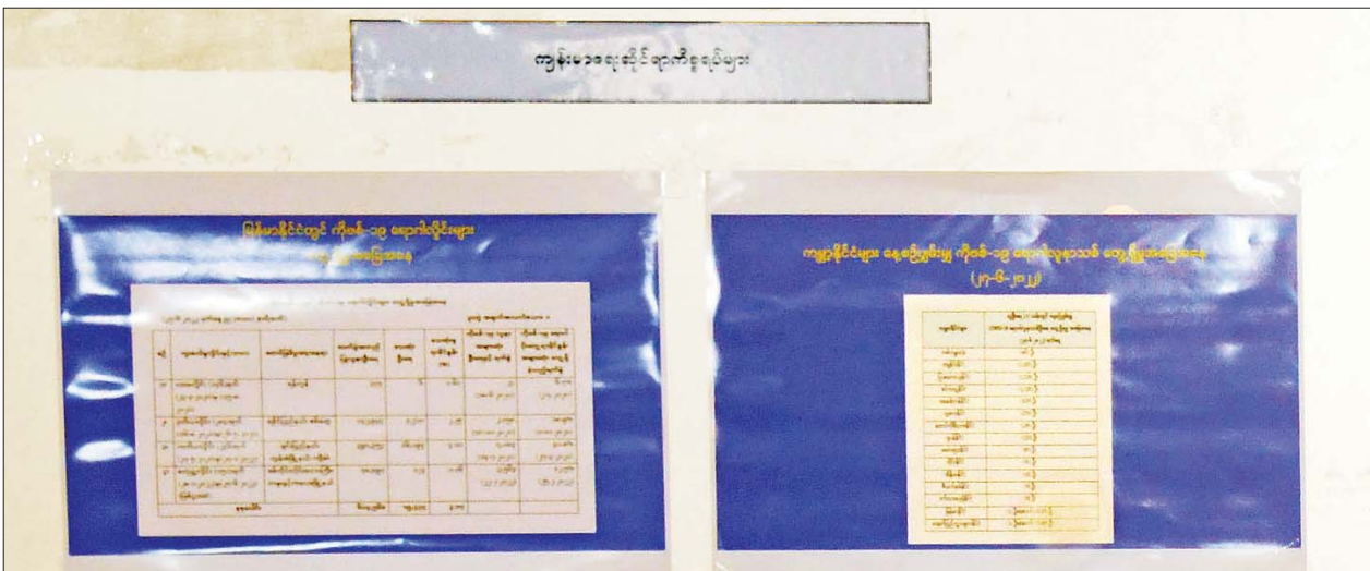
သတင်းစာရှင်းလင်းပွဲတွင် ပြသထားသည့် ကိုဗစ်-၁၉ ကာကွယ်ရေးနှင့် ကျန်းမာရေးဆောင်ရွက်မှု မှတ်တမ်းဇယားပုံများ။

ဆက်လက်ပြီး တက္ကသိုလ်၊ ကောလိပ်များ ဖွင့်လှစ်သင်ကြားမှုအနေဖြင့် ၂၀၂၂ ခုနှစ် မေ ၁၂ ရက်တွင် စတင်ဖွင့်လှစ်ခဲ့သည့် ၂၀၁၉-၂၀၂၀ ပညာသင်နှစ်၊ ၂၀၂၁-၂၀၂၂ ပညာသင်နှစ်နှင့် ၂၀၂၂-၂၀၂၃ ပညာသင်နှစ်များအတွက် ဘွဲ့ကြိုသင်တန်းများနှင့် ပါရဂူသင်တန်းများ အပါအဝင် ဘွဲ့လွန်သင်တန်းများအားလုံးကို တက္ကသိုလ်၊ ဒီဂရီကောလိပ်နှင့် ကောလိပ် ၄၉ ကျောင်းတွင် ဖွင့်လှစ်ခဲ့ရာ စာရင်းရှိ ၂၉၉၅၁၃ ဦး (နှစ်သိန်း ကိုးသောင်းကျော်)၊ ကျောင်းအပ်နှံမှု ၂၄၆၅၃၁ ဦး (နှစ်သိန်း လေးသောင်းကျော်ရှိပြီး ၇၂၆၆၀ ဦး (ခုနှစ်သောင်း နှစ်ထောင်ကျော်)