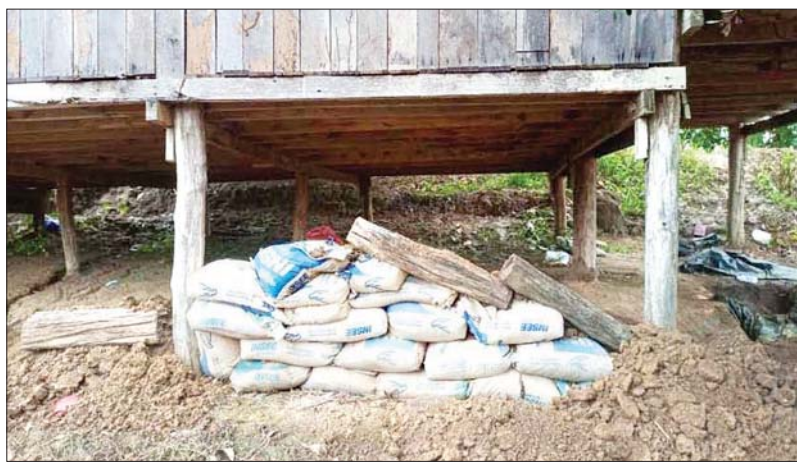
အကြမ်းဖက်သောင်းကျန်းသူများက ကျေးရွာအတွင်း လူနေအဆောက်အဦများကို အကာအကွယ်ပြု၍ တပ်မတော်စစ်ကြောင်းအား တိုက်ခိုက်ခဲ့သောနေရာ မှတ်တမ်းဓာတ်ပုံ။