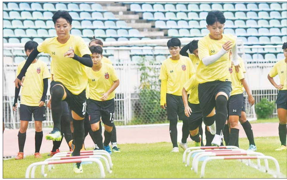
မြန်မာ့လက်ရွေးစင် အမျိုးသမီးအသင်း ဇွန်လကုန်ပိုင်းက ရန်ကုန်မြို့၌ လေ့ကျင့်နေစဉ်။

ရန်ကုန် ဇူလိုင် ၃ ၂၀၂၂ အာဆီယံ အမျိုးသမီးချန်ပီယံ ရှစ်ပြိုင်ပွဲ ယှဉ်ပြိုင်ရန်အတွက် မြန်မာ့လက်ရွေးစင် အမျိုးသမီး အသင်းသည် ဖိလစ်ပိုင်နိုင်ငံသို့ ရောက်ရှိနေပြီ ဖြစ်သည်။ မြန်မာ့လက်ရွေးစင် အမျိုး သမီးအသင်းသည် ပြိုင်ပွဲဝင်ရန် ဇူလိုင် ၂ ရက် နံနက်ပိုင်းက ရန်ကုန် မြို့မှ ထွက်ခွာခဲ့ပြီး ယင်းနေ့ညပိုင်း တွင် မနီလာမြို့သို့ ရောက်ရှိခဲ့ခြင်း ဖြစ်သည်။ အာဆီယံ အမျိုးသမီး ချန်ပီယံရှစ်ပြိုင်ပွဲ ယှဉ်ပြိုင်မည့် မြန်မာ့လက်ရွေးစင် အမျိုးသမီး အသင်းတွင် အုပ်ချုပ်/နည်းပြ အဖွဲ့ဝင် ၁၁ ဦး၊ ကစားသမား ၂၇ ဦး လိုက်ပါသွားသည်။ မြန်မာ့