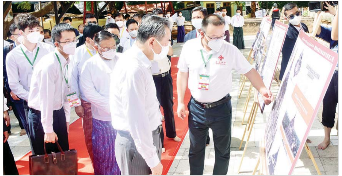
ပြည်ထောင်စုဝန်ကြီး ဦးဝဏ္ဏမောင်လွင်နှင့် တရုတ်ပြည်သူ့သမ္မတနိုင်ငံ နိုင်ငံတော်ကောင်စီဝင်နှင့် နိုင်ငံခြားရေးဝန်ကြီး မစ္စတာ ဝမ်ယီ တို့ အား သဗ္ဗညုဘုရားပြုပြင်ရေးစီမံကိန်း နည်းပညာပိုင်းဆိုင်ရာ ခေါင်းဆောင် မစ္စတာ လွီယွမ်ပင်း က ပြုပြင်ရေးဆောင်ရွက်နေမှု အခြေအနေများကို ရှင်းလင်းတင်ပြစဉ်။