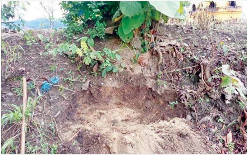
အကြမ်းဖက်သောင်းကျန်းသူများက စေတီပုထိုးနှင့် ဘာသာရေး အဆောက်အဦများကို အကာအကွယ်ပြု၍တပ်မတော်စစ်ကြောင်းအား တိုက်ခိုက်ခဲ့သောနေရာ မှတ်တမ်းဓာတ်ပုံ။