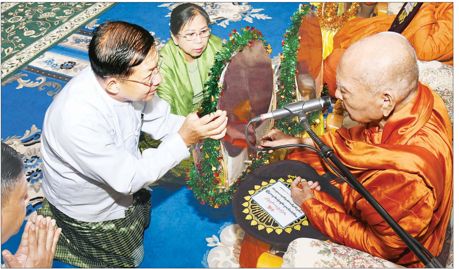
နိုင်ငံတော်စီမံအုပ်ချုပ်ရေးကောင်စီဥက္ကဋ္ဌ နိုင်ငံတော်ဝန်ကြီးချုပ် ဗိုလ်ချုပ်မှူးကြီး မင်းအောင်လှိုင်နှင့် ဇနီး ဒေါ်ကြူကြူလှတို့ ဗန်းမော်ဆရာတော်ဘုရားကြီးထံ လှူဖွယ်ပစ္စည်းများ ဆက်ကပ်လှူဒါန်းစဉ်။

စတင်တည်ထောင်တော်မူခဲ့ကြောင်း၊ ထို့နောက် ကျောင်းတိုက်ကြီးကို လက်ဆင့်ကမ်း၍ အစဉ်အဆက် ထိန်းသိမ်းစောင့်ရှောက်ခဲ့ကြပြီး ယခုကျောင်းလွတ် ပူဇော်သင်ပြလုပ်သည့် အနန္တသုခ (၅) ထပ် ဓမ္မ ဗိမာန်ကျောင်းတော်ကြီးကို တပ်မတော် ကာကွယ် ရေးဦးစီးချုပ် ဗိုလ်ချုပ်မှူးကြီး မင်းအောင်လှိုင် အမှူးပြု သည့် ကျောင်းဒါယကာ၊ ဒါယိကာမများက ၂၀၂၀ ပြည့်နှစ် ဇန်နဝါရီ ၁၂ ရက်တွင် ပန္နက်တော်တင် မင်္ဂလာအခမ်းအနား ပြုလုပ်၍ လှူဒါန်းခဲ့ခြင်းဖြစ် ကြောင်း၊ အလျား ၁၀၈ ပေ၊ အနံ ၄၅ ပေရှိ (၅) ထပ် ကျောင်းတော်ကြီးမှာ ဘဒ္ဒန္တ အာဝဓ၊ ပဓာန နာယက ဓမ္မစကြာရိပ်သာဆရာတော်အား အမှူးထား၍ နိုင်ငံတော်စီမံအုပ်ချုပ်ရေးကောင်စီ ဥက္ကဋ္ဌ နိုင်ငံတော် ဝန်ကြီးချုပ်နှင့် ဇနီး အမှူးပြုသော တပ်မတော် (ကြည်း၊ ရေ၊ လေ) မိသားစုများ၊ အဂ္ဂမဟာသီရိသုဓမ္မ မဏိဇောတရေ ကျောင်းဒါယကာ ဒေါက်တာ သာရင်မြတ်၊ ဇနီး သီဟသုဓမ္မသီရီ လူမှုထူးချွန် ကျောင်းဒါယကာမ ဒေါ်နွယ်နွယ်အေးနှင့် မိသားစုဝင် များက မတည်လှူဒါန်းပြီး Four River Myanmar Co.,Ltd အမေရိကန် ကုမ္ပဏီမိသားစုနှင့် စေတနာရှင် အလှူရှင်များ စုပေါင်း၍ ငွေကျပ် သိန်းပေါင်း တစ်သောင်းကျော် ကုန်ကျခံ တည်ဆောက်လှူဒါန်း ခဲ့ခြင်းဖြစ်ကြောင်း သတင်းရရှိသည်။ သတင်းစဉ်