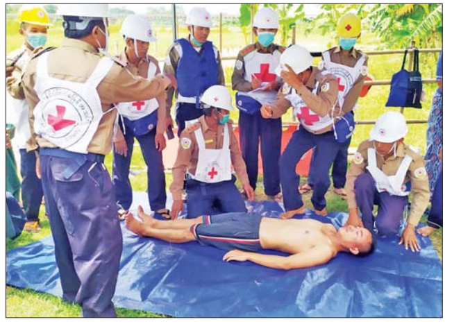
ရေနစ်သူအား ရှေးဦးသူနာပြုစုခြင်း ဆောင်ရွက်ပေးနေစဉ်။

ရေးဦးစီးဌာနမှ ကျန်းမာရေးမှူး ဦးကျော်ကျော်နိုင်က ကျန်းမာရေးနှင့် ပတ်သက်၍ လိုက်နာရမည့် အချက်များကို ရှင်းလင်းပြောကြားသည်။ ဆက်လက်၍ ရေဘေးအန္တရာယ် သဏ္ဍာန်တူသရုပ်ပြလေ့ကျင့်ခြင်း ကို ဆောင်ရွက်ခဲ့ရာ သဘာဝဘေးကြုံတွေ့လာပါက သတင်းပို့ခြင်း၊ သတိပေးကြေညာခြင်း၊ ရေဘေးသင့်ပြည်သူများအား ကယ်ဆယ်ခြင်း၊ ဆေးကုသမှုဆောင်ရွက်ပေးခြင်း၊ ရေနစ်သူအား ကယ်ဆယ်၍ ရှေးဦး သူနာပြုစုခြင်းများကို ဘေးအန္တရာယ်ဆိုင်ရာ စီမံခန့်ခွဲမှုဦးစီးဌာန၊ မြို့နယ်စီမံသတ်တံဖွဲ့၊ ကြက်ခြေနီတပ်ဖွဲ့တို့မှ ဦးဆောင်၍ ဌာနဆိုင်ရာ များနှင့် ဒေသခံပြည်သူများ ပူးပေါင်းဆောင်ရွက်ခဲ့သည်။ အဆိုပါ သရုပ်ပြလေ့ကျင့်ခြင်းကို ခရိုင်သဘာဝဘေးအန္တရာယ် ဆိုင်ရာ စီမံခန့်ခွဲမှုအဖွဲ့ဥက္ကဋ္ဌနှင့်အဖွဲ့ဝင်များ၊ ဌာနဆိုင်ရာများ၊ ကျေးရွာ နေပြည်သူများက တက်ရောက်ကြည့်ရှုခဲ့ကြသည်။ ကိုမင်း(ပြန်/ဆက်)