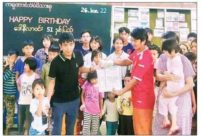
ကရုဏာစံအိမ် မိဘမဲ့ဂေဟာမှ ဂုဏ်ပြုမှတ်တမ်းလွှာများ ပေးအပ် တာဝန်ရှိသူများက အလှူရှင် ကြောင်း သိရသည်။ မိသားစုများအား ကျေးဇူးတင် ချယ်ရီမြေ(မူဆယ်)