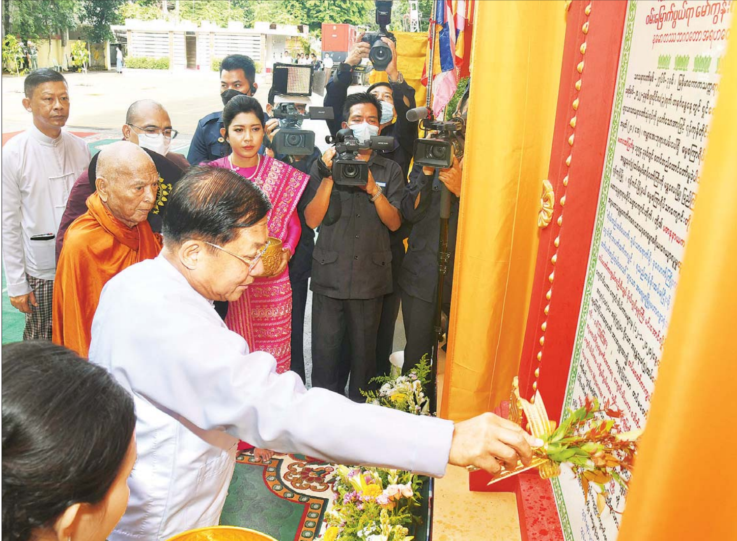
နိုင်ငံတော်စီမံအုပ်ချုပ်ရေးကောင်စီဥက္ကဋ္ဌ နိုင်ငံတော်ဝန်ကြီးချုပ် ဗိုလ်ချုပ်မှူးကြီး မင်းအောင်လှိုင် အနန္တသုခ (၅) ထပ် ဓမ္မဗိမာန်ကျောင်းတော်ကြီး ကမ္ဘာ့အေးဘုရားလမ်း အမွှေးနံ့သာရည်များ ပက်ဖျန်းပူဇော်စဉ်။

နေပြည်တော် ဇူလိုင် ၃ နိုင်ငံတော်စီမံအုပ်ချုပ်ရေးကောင်စီ ဥက္ကဋ္ဌ နိုင်ငံတော်ဝန်ကြီးချုပ် ဗိုလ်ချုပ်မှူးကြီး မင်းအောင်လှိုင် သည် ကမ္ဘာ့အေးဘုရားလမ်း ဓမ္မစကြာရိပ်သာ ကျောင်းတိုက်ရှိ အနန္တသုခ (၅) ထပ် ဓမ္မဗိမာန် ကျောင်းတော်ကြီး ကျောင်းလွတ် ပူဇော်ပွဲသို့ ယနေ့နံနက်ပိုင်းတွင် တက်ရောက်ဖွင့်လှစ်သည်။ အဆိုပါ အခမ်းအနားသို့ မန္တလေးမြို့ ဗန်းမော် ကျောင်းတိုက် ဆရာတော် နိုင်ငံတော်သံဃမဟာ နာယကအဖွဲ့ ဥက္ကဋ္ဌ အဘိဓဇ မဟာရဋ္ဌဂုရု အဘိဓဇ အဂ္ဂမဟာသဒ္ဓမ္မဇောတိကဓဇ ဒေါက်တာဘန္တုကမာရ ဘိဝံသ ဗန်းမော် ဆရာတော်ဘုရားကြီး အမျိုးပြုသည့် ဆရာတော်၊ သံဃာတော်များ ကြွရောက်ချီးမြှင့် တော်မူကြပြီး နိုင်ငံတော်စီမံအုပ်ချုပ်ရေးကောင်စီ ဥက္ကဋ္ဌ နိုင်ငံတော်ဝန်ကြီးချုပ် ဇနီး ဒေါ်ကြူကြူလှ၊ မိသားစုဝင်များနှင့်အတူ ခရီးစဉ်တွင် လိုက်ပါလာ သည့် အဖွဲ့ဝင်များနှင့် ဇနီးများ၊ ရန်ကုန်တိုင်းဒေသ ကြီး ဝန်ကြီးချုပ်နှင့် ဇနီး၊ ရန်ကုန်တိုင်းစစ်ဌာနချုပ် တိုင်းမှူးနှင့်ဇနီး၊ မြို့တော်ဝန်နှင့် ဇနီး၊ အလှူရှင် များနှင့် တာဝန်ရှိသူများ၊ ဖိတ်ကြားထားသူများ တက်ရောက်ကြသည်။ ဦးစွာ နိုင်ငံတော်စီမံအုပ်ချုပ်ရေးကောင်စီ ဥက္ကဋ္ဌ နိုင်ငံတော်ဝန်ကြီးချုပ်နှင့် အဖွဲ့ဝင်များသည် အခမ်း အနားပြုလုပ်မည့်နေရာသို့ ရောက်ရှိကြပြီး ရန်ကုန် တိုင်းဒေသကြီး ဝန်ကြီးချုပ်၊ တိုင်းမှူးနှင့် ကျောင်း ဒါယကာအလှူရှင် ဒေါက်တာ သာရင်မြတ် တို့က အခမ်းအနားကို ဖဲကြိုးဖြတ်ဖွင့်လှစ်သည်။ စာမျက်နှာ ၃ ကော်လံ ၁