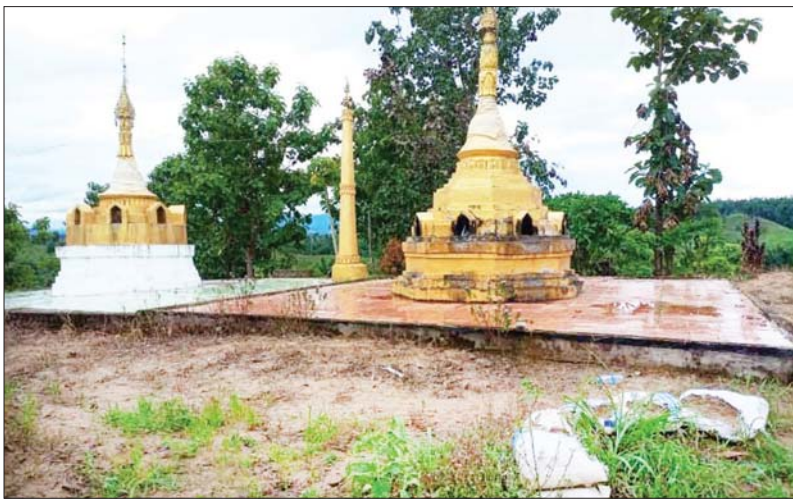
အကြမ်းဖက်သောင်းကျန်းသူများက စေတီပုထိုးနှင့် ဘာသာရေး အဆောက်အဦများကို အကာအကွယ်ပြု၍ တပ်မတော်စစ်ကြောင်းအား တိုက်ခိုက်ခဲ့သောနေရာ မှတ်တမ်းဓာတ်ပုံ။

နေပြည်တော် ဇူလိုင် ၃ ဥကရစ်ထစခန်းအား KNLA အဖွဲ့နှင့် PDF အမည်ခံအကြမ်းဖက်ပူးပေါင်းအဖွဲ့က အင်အားအလုံးအရင်းအသုံးပြု၍ အကြိမ်ကြိမ်တိုက်ခိုက်ခဲ့သော်လည်း အဆိုပါစခန်းမှ တပ်မတော်သားများအနေဖြင့် မြေပြင်ပစ်ကူနှင့် လေကြောင်းပစ်ကူများရယူ၍ ရွပ်ရွပ်ချွံချွံ မဆုတ်မနစ် ကြံ့ကြံ့ခိုင်သော စိတ်ဓာတ်ဖြင့် အသက်ကို ပဓာနမထားဘဲ ခုခံတိုက်ခိုက်ခဲ့မှု၊ စစ်ကူစစ်ကြောင်းများအနေဖြင့်လည်း ရာသီဥတုနှင့် အခြားသော မြေအနေအထား ကန့်သတ်ချက်များကြားမှ ဥကရစ်ထစခန်းရှိ တပ်မတော်သားများနှင့် တပ်ချင်းချိတ်ဆက်ပူးပေါင်းကာ ဥကရစ်ထစခန်းနှင့် ပတ်ဝန်းကျင်တစ်ဝိုက် နယ်မြေလုံခြုံရေး လုပ်ငန်းများ ဆောင်ရွက်နိုင်ခဲ့မှုကို ဇူလိုင် ၂ ရက်တွင် အချိန်နှင့်တစ်ပြေးညီ သတင်းထုတ်ပြန်ခဲ့ပြီး ဖြစ်သည်။ ထိုသို့ အချိန်နှင့်တစ်ပြေးညီ သတင်းထုတ်ပြန်နိုင်ရေး ဆောင်ရွက်ခဲ့ရာတွင် အချိန်အခက်အခဲကြောင့် မှတ်တမ်းဓာတ်ပုံများ၊ အထောက်အထားများ ပြည့်စုံစွာ