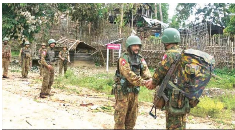
ဥကရစ်ထစစ်ဆင်ရေးခြေကုပ်စခန်းရှေ့၌ ရွပ်ရွပ်ချွံချွံ ခုခံကာကွယ်ခဲ့သည့် ခြေကုပ်စခန်းမှ တပ်မတော်သားများနှင့် စစ်ကူစစ်ကြောင်းတို့ တပ်ချင်းချိတ်ဆက်သတင်းပို့မှု မှတ်တမ်းဓာတ်ပုံ။