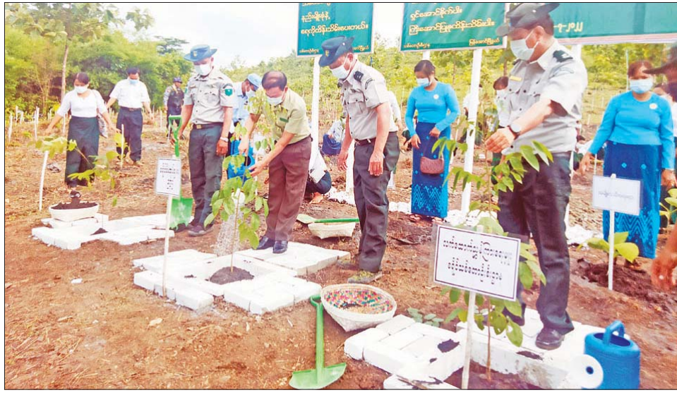
၄၄၀၊ မန်ဂျန်ရှားပင် ၄၀၀ တို့ကို စုပေါင်းစိုက်ပျိုးခဲ့ကြကြောင်း သိရသည်။ ထို့နောက် ခရိုင်ဥက္ကဋ္ဌနှင့် တာဝန်ရှိသူများက

မြန်မာအမျိုးသမီးများနေ့အထိမ်းအမှတ် သစ်ပင်စိုက်ပျိုးပွဲကို ယနေ့နံနက်ပိုင်းက ဧရာဝတီတိုင်းဒေသကြီး မြန်အောင်ခရိုင် မြန်အောင်မြို့နယ် မြှင့်ဝါးတောင်ကျေးရွာအုပ်စု မြှင့်ဝါးတောင်ကျေးရွာ ပုသိမ်-မုံရွာကားလမ်း မိုင်တိုင်(၇၇/၂)အနီး မြှင့်ဝါးတောင်ကြိုးပိုင်းအကွက် အမှတ်(၅၂) ၌ ကျင်းပသည်။