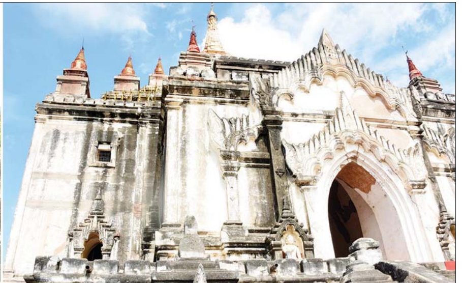
ပြည်ထောင်စုဝန်ကြီး ဦးဝဏ္ဏမောင်လွင်နှင့် တရုတ်ပြည်သူ့သမ္မတနိုင်ငံ နိုင်ငံတော်ကောင်စီဝင်နှင့် နိုင်ငံခြားရေးဝန်ကြီး မစ္စတာ ဝမ်ယီ တို့ တရုတ်ပြည်သူ့သမ္မတနိုင်ငံ အထောက် အပံ့ဖြင့် ဆောင်ရွက်လျက်ရှိသည့် သဗ္ဗညုဘုရားပြုပြင်ရေးစီမံကိန်းကို ကြည့်ရှုစစ်ဆေးစဉ်။

အခမ်းအနားသို့ နိုင်ငံခြားရေး ဝန်ကြီးဌာန ပြည်ထောင်စုဝန်ကြီး ဦးဝဏ္ဏမောင်လွင်၊ တရုတ်ပြည်သူ့ သမ္မတနိုင်ငံ နိုင်ငံတော်ကောင်စီ ဝင်နှင့် နိုင်ငံခြားရေးဝန်ကြီး မစ္စတာ ဝမ်ယီ၊ ဒုတိယဝန်ကြီး ဦးကျော်မျိုးထွဋ်၊ မြန်မာနိုင်ငံ ဆိုင်ရာ တရုတ်ပြည်သူ့သမ္မတ နိုင်ငံသံအမတ်ကြီး မစ္စတာ ချန်းဟိုင်၊ မန္တလေးတိုင်းဒေသကြီး သယံဇာတနှင့် သဘာဝပတ်ဝန်း ကျင်ထိန်းသိမ်းရေးဝန်ကြီး ဦးမျိုး အောင်နှင့် တာဝန်ရှိသူများ တက် ရောက်ကြသည်။ ရှေးဦးစွာ အခမ်းအနားတွင်