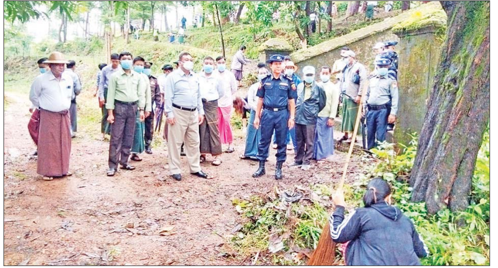
ကြရန်နှင့် မြို့နယ်အတွင်း သန့်ရှင်းသာယာလှပရေး၊ ရေစီးရေလာကောင်းမွန်ရေး၊ ရေနုတ်မြောင်း၊ အများပြည်သူနှင့် သက်ဆိုင်သည့်နေရာများတွင် စုပေါင်းသန့်ရှင်းရေးလုပ်ငန်းများ ဆောင်ရွက်ကြရန် တာဝန်ရှိသူများကို မှာကြားခဲ့ကြောင်း သိရသည်။ ခရိုင်(ပြန်/ဆက်)

များက လိုက်လံကြည့်ရှုအားပေးခဲ့ပြီး ပြည်နယ်ဝန်ကြီးချုပ်က မော်လမြိုင်မြို့နယ် တောင်ရိုးတန်းလမ်းသည် အများပြည်သူများ စိတ်အပန်းဖြေ လာရောက်သည့် နေရာဒေသဖြစ်ကြောင်း၊ ဘုရားဖူးပြည်သူများ လာရောက်လည်ပတ်သည့်စေတီ၊ ပုထိုးများ စုံရာနေရာဖြစ်ခြင်း၊ ကျန်းမာရေးလိုက်စားသူများ အနေဖြင့် ကိုယ်လက်လှုပ်ရှားအားကစားများ ဆောင်ရွက်ခြင်း၊ တောင်ရိုးတန်းလမ်းတစ်လျှောက် လမ်းလျှောက်ခြင်းများ၊ အသက်ရှူလေ့ကျင့်ခန်းများ လာရောက်ဆောင်ရွက်ကြသည့်အတွက် ပတ်ဝန်းကျင်သန့်ရှင်းသာယာလှပပြီး လေကောင်းလေသန့်များ ရှူရှိုက်ရာတွင် ကောင်းမွန်စေရေး အလေးထားဆောင်ရွက်