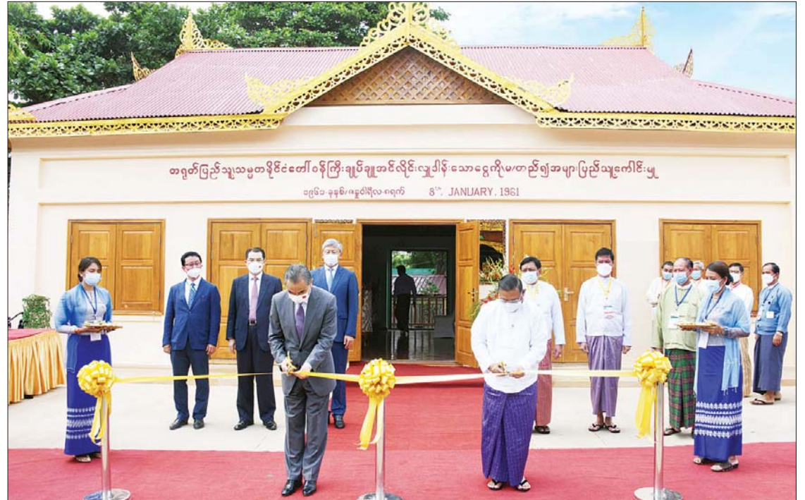
ပြည်ထောင်စုဝန်ကြီး ဦးဝဏ္ဏမောင်လွင်နှင့် တရုတ်ပြည်သူ့သမ္မတနိုင်ငံ နိုင်ငံတော်ကောင်စီဝင်နှင့် နိုင်ငံခြားရေးဝန်ကြီး မစ္စတာ ဝမ်ယီ တို့ ချူအင်လိုင်း တန်ဆောင်းကို ဖဲကြိုးဖြတ်ဖွင့်လှစ်ပေးစဉ်။