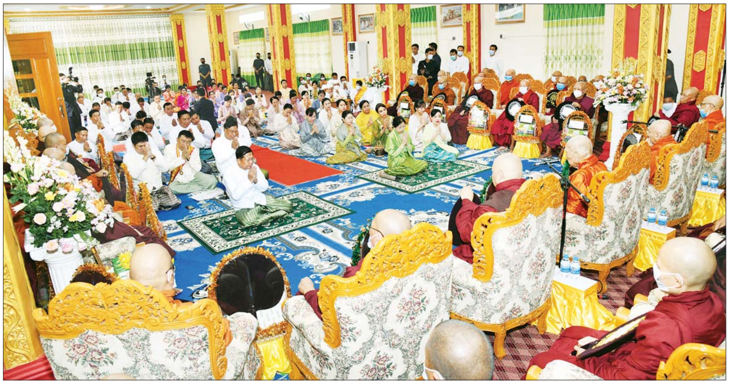
နိုင်ငံတော်စီမံအုပ်ချုပ်ရေးကောင်စီဥက္ကဋ္ဌ နိုင်ငံတော်ဝန်ကြီးချုပ် ဗိုလ်ချုပ်မှူးကြီး မင်းအောင်လှိုင်၊ ဇနီး ဒေါ်ကြူကြူလှနှင့် ဧည့်ပရိသတ်တို့က ဗန်းမော်ဆရာတော်ဘုရားကြီးထံမှ ငါးပါးသီလခံယူဆောက်တည်ကြစဉ်။

ယင်းနောက် နိုင်ငံတော်စီမံအုပ်ချုပ်ရေးကောင်စီဥက္ကဋ္ဌ နိုင်ငံတော်ဝန်ကြီးချုပ်နှင့် ဇနီးတို့က