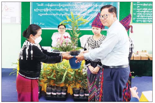
လိုအပ်ချက်နှင့်အညီ နို့နှင့်နို့ထွက်ပစ္စည်း တိုးမြှင့်ထုတ်လုပ်နိုင်ရေး အဓိကထား လုပ်ဆောင်ကြရန် မှာကြားသည်။ ဆက်လက်၍ ဒုတိယဝန်ကြီးနှင့် အဖွဲ့သည် မြစ်ကြီးနားခရိုင် ဝိုင်းမော်မြို့နယ် ဝါရောင်ရေလွှဲဆည် သို့ရောက်ရှိပြီး ကချင်ပြည်နယ် အတွင်း ရေအသုံးချသူများအဖွဲ့ (WUG) နှင့် ရေအသုံးချသူများ အသင်း (WUA) များ ဖွဲ့စည်းနိုင်ရေးနှင့် ဖွဲ့စည်းပြီးအသင်းအဖွဲ့များအား ပိုမို အားကောင်းလာစေရေး ဆက်လက်ဆောင်ရွက်ရန်နှင့် စိုက်ပျိုးရေး လုံလောက်စွာပေးဝေ နိုင်ရေးတို့ကို မှာကြားခဲ့ကြောင်း သိရသည်။

ကြရန် ပြောကြားသည်။ ဆက်လက်၍ ပြည်နယ်ဝန်ကြီးချုပ်က မက္ကဒေးမီးယားပျိုးပင်များကို အောင်မြင်ဖြစ်ထွန်းအောင် စိုက်ပျိုးကြရန်နှင့် လိုအပ်သော စိုက်ပျိုး ရေးဆိုင်ရာနည်းပညာနှင့် အကြံဉာဏ်များအား စိုက်ပျိုးရေးဦးစီးဌာနနှင့် ဆက်သွယ်ဆောင်ရွက်ကြရန်၊ စိုက်ပျိုး ရေး ဦးစီးဌာနအနေဖြင့် ခရိုင်၊ မြို့နယ်အလိုက် အဆင့်မြှင့်တင်ဆောင်ရွက်သွားကြရန် မှာကြား သည်။ ထို့နောက် မက္ကဒေးမီးယားပျိုးပင် ၁၄၈၀ နှင့် အသီးခူးဧက ၁၇ ဧကအတွက် အခွဲစားကိရိယာ နှစ်လုံး၊ အခွဲစိမ်းနှွာစက် တစ်လုံး တို့အား တောင်သူများထံ ပေးအပ်ခဲ့ပြီး တက်ရောက်လာကြသော တောင်သူတစ်ဦးက ကျေးဇူးတင်စကား ပြောကြားသည်။ ထို့နောက် မြစ်ကြီးနားပိုးစာခြံသို့ ရောက်ရှိပြီး ဒေသအတွင်း ပိုးစာတောင်သူများကို အထွက်ကောင်း ပိုးစာမျိုးသန့်များ ဖြန့်ဖြူးပေးရန်၊ သိပ္ပံနည်းကျ စိုက်ပျိုးထိန်းသိမ်းခြင်း၊ မွေးမြူထုတ်လုပ်ခြင်းနည်းပညာများ ဖြန့်ဖြူး ပေးခြင်း၊ ပိုးစာနှင့် ဆက်စပ်လုပ်ငန်းများမှ ဒေသအတွင်း ပြည်သူများ အလုပ်အကိုင် အခွင့်အလမ်းများရရှိစေရန် မှာကြားသည်။ ယင်းနောက် စူပါဝမ်း နို့စားနွား မွေးမြူရေးခြံနှင့် ချမ်း နို့စားနွား မွေးမြူရေးခြံတို့ကို ရောက်ရှိပြီး နို့ထွက် နှုန်းကောင်းမွန်သော နို့စားနွား မျိုးကောင်းမျိုးသန့်များ ပိုမိုဖြစ်ထွန်းမွေးမြူနိုင်ရေးအတွက် လိုအပ်သော နည်းပညာနှင့် သွင်းအားစုများဖြစ်သည့် စနစ်တကျ မေထုန်မဲ့ သားစပ် လုပ်ငန်းများ၊ မွေးမြူသူတောင်သူများ အကျိုးအမြတ်ရရှိရေး ဈေးကွက်