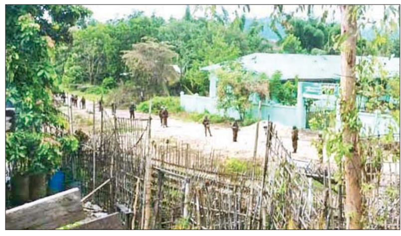
ဥကရစ်ထစစ်ဆင်ရေးခြေကုပ်စခန်းရှေ့၌ ရွပ်ရွပ်ချွံချွံ ခုခံကာကွယ်ခဲ့သည့် ခြေကုပ်စခန်းမှ တပ်မတော်သားများနှင့် စစ်ကူစစ်ကြောင်းတို့ တပ်ချင်းချိတ်ဆက်သတင်းပို့မှု မှတ်တမ်းဓာတ်ပုံ။