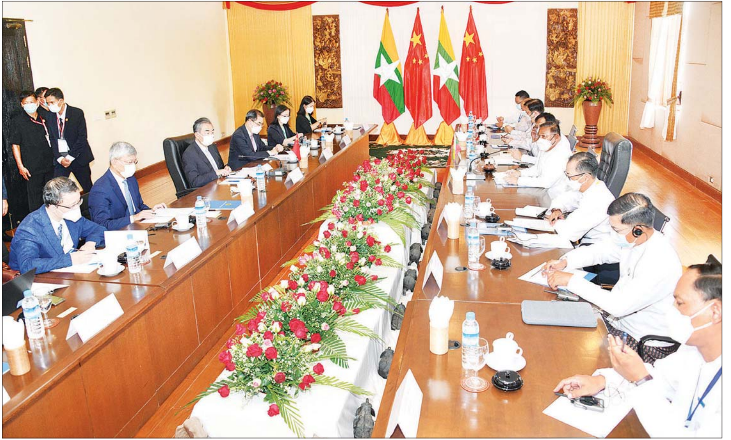
ပြည်ထောင်စုဝန်ကြီး ဦးဝဏ္ဏမောင်လွင်နှင့် တရုတ်ပြည်သူ့သမ္မတနိုင်ငံ နိုင်ငံတော်ကောင်စီဝင်နှင့် နိုင်ငံခြားရေးဝန်ကြီး မစ္စတာ ဝမ်ယိ တို့ တွေ့ဆုံဆွေးနွေးစဉ်။

ယင်းနောက် ပြည်ထောင်စုဝန်ကြီးက မြန်မာ နိုင်ငံ၏ နောက်ဆုံးနိုင်ငံရေး ဖြစ်ပေါ်တိုးတက်မှု များနှင့် နိုင်ငံတော်စီမံအုပ်ချုပ်ရေးကောင်စီ၏ ရှေ့လုပ်ငန်းစဉ်(၅)ရပ် အောင်မြင်စွာ ဖော်ဆောင်နေမှု တို့ကို တရုတ်နိုင်ငံ နိုင်ငံတော်ကောင်စီနှင့် နိုင်ငံခြား