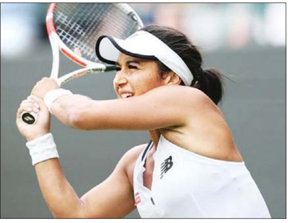
ဗြိတိန် တင်းနစ်မယ် ဝက်ဆန်

ဝင်ဘယ်ဒန် အမျိုးသမီးတစ်ဦးချင်းပြိုင်ပွဲ တတိယအဆင့်တွင် နာမည်ကြီး ဆွီယာ တက်ခါ၊ ကိုကိုဂျိမ်းတို့ ပြိုင်ပွဲမှ ထွက်ခွာ ခဲ့ပြီး ဝက်ဆန် နောက်တစ်ဆင့် တက်ရောက်နိုင်ခဲ့ကြောင်း သိရသည်။ ဖလားဆွတ်ခူးရန် ထင်ကြေးပေး ခြင်းခံနေရသည့် ကမ္ဘာ့နံပါတ်တစ် ပိုလန် တင်းနစ်မယ် ဆွီယာတက်ခါသည် ပြိုင်ဘက်ပြင်သစ်တင်းနစ်မယ်ကော်နက် ကို ၆-၄၊ ၆-၂ ဖြင့် ရှုံးနိမ့်ကာ ပြိုင်ပွဲမှ ထွက်ခွာခဲ့ရခြင်း ဖြစ်သည်။ ထို့အပြင် ဆွီယာတက်ခါသည် ယခုပွဲစဉ် ရှုံးနိမ့်မှု ကြောင့် ၎င်း၏ ၃၇ ပွဲဆက် နိုင်ပွဲရရှိမှု စံချိန်လည်း ကျိုးပျက်ခဲ့ရပြီဖြစ်သည်။ အမျိုးသမီးတစ်ဦးချင်းပြိုင်ပွဲ တတိယ အဆင့်မှ အခြားသော ပွဲစဉ်အဖြစ် အမေရိကန်တင်းနစ်မယ် ကိုကိုဂျိမ်းနှင့် အနစ်ဆီမိုလာ တို့ပွဲစဉ်တွင်လည်း နာမည်