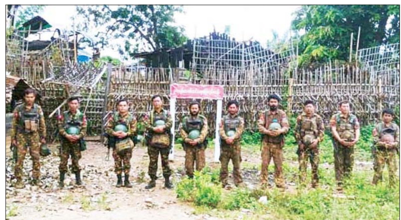
ဥကရစ်ထစစ်ဆင်ရေးခြေကုပ်စခန်းရှေ့၌ ရွပ်ရွပ်ချွံချွံ ခုခံကာကွယ်ခဲ့သည့် ခြေကုပ်စခန်းမှ တပ်မတော်သားများနှင့် စစ်ကူစစ်ကြောင်းတို့ တပ်ချင်းချိတ်ဆက်ပြီး မှတ်တမ်းဓာတ်ပုံ။

ဖော်ပြနိုင်ခြင်းမရှိခဲ့သဖြင့် အဆိုပါစစ်ကူ စစ်ကြောင်းများနှင့် ဥကရစ်ထစခန်းမှ တပ်မတော်သားများ တပ်ချင်းချိတ်ဆက်ပူးပေါင်းနိုင်မှု မှတ်တမ်းဓာတ်ပုံများကို ထပ်မံဖော်ပြပါသည်။ ထို့ပြင် ဥကရစ်ထစခန်းအနီးပတ်ဝန်းကျင်တစ်ဝိုက်အား နယ်မြေလုံခြုံရေး လုပ်ငန်းများ ဆောင်ရွက်ခဲ့ရာတွင်လည်း KNLA အဖွဲ့နှင့် PDF အမည်ခံအကြမ်းဖက်ပူးပေါင်းအဖွဲ့အနေဖြင့် ဥကရစ်ထစခန်းကို လာရောက်တိုက်ခိုက်ခဲ့စဉ် စေတီပုထိုးများ၊ ဘာသာရေးအဆောက်အဦများနှင့် လူနေအဆောက်အဦများကို အကာအကွယ်ယူ၍ တိုက်ခိုက်ခဲ့သည့် နေရာများကိုလည်း တွေ့ရှိရသည်။ တပ်မတော်စစ်ကြောင်းများအနေဖြင့် ဥကရစ်ထနယ်မြေအတွင်း အကြမ်းဖက်သမားများ ခိုအောင်းအခြေချနေထိုင်မှု မရှိစေရေးအတွက် လိုအပ်သည့် လုံခြုံရေး လုပ်ငန်းများကို ဆက်လက်ဆောင်ရွက်လျက် ရှိကြောင်း သတင်းရရှိသည်။ သတင်းစဉ်