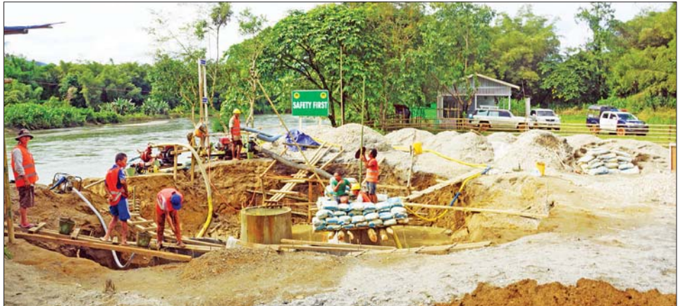
ပူတာအိုဒေသ ဖွံ့ဖြိုးရေးလုပ်ငန်းများ ဆောင်ရွက်နေစဉ်။

ပြီး အထက်ဆန်ဂေါင်-လုံနဒမ်း- ဇီယာဒမ်း(ရေခဲတောင်)သွားလမ်း အရှည် ၂၄ မိုင်တွင် အကောင် အထည်ဖော်ဆောင်ရွက်သွားမည့် လုပ်ငန်းအစီအမံများနှင့်လုပ်ငန်း လိုအပ်ချက်များကို ရှင်းလင်း တင်ပြရာ ပြည်နယ်ဝန်ကြီးက ပေါင်းစပ်ဆောင်ရွက်ပေးခဲ့သည်။ အဆိုပါ လမ်းသည် လမ်း အရှည်မှာ ၂၄ မိုင် ရှည်သော လမ်းဖြစ်ပြီး ကျေးရွာ ရှစ်ရွာ၊ အိမ်ခြေ ၃၈၂ အိမ်၊ လူဦးရေ ၁၁၃၉ ဦးအား အကျိုးပြုမည့် အပြင် အဆိုပါ လမ်းပိုင်း ဆောင်ရွက်ပြီးစီးပါက ရေခဲ တောင်ခရီးစဉ်အဖြစ် Eco Tourism လုပ်ငန်းအတွက် အထူး အရေးပါသောလမ်း တစ်လမ်း ဖြစ်လာမည်ဖြစ်ကြောင်း သိရ သည်။ ခရိုင် (ပြန်/ဆက်)