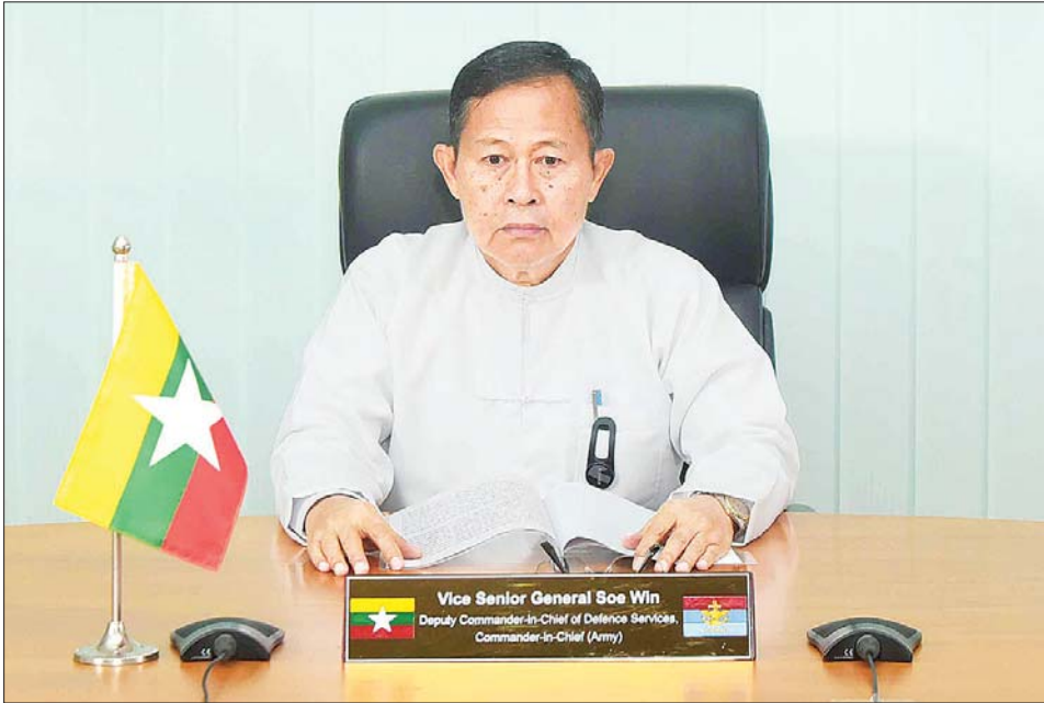
၂၀၂၂ ခုနှစ် ၊ ဇူလိုင်လ (၃) ရက်နေ့တွင် ကျရောက်သည့် မြန်မာအမျိုးသမီးများနေ့ အထိမ်းအမှတ်အခမ်းအနားတွင် နိုင်ငံတော်စီမံအုပ်ချုပ်ရေးကောင်စီဥက္ကဋ္ဌ နိုင်ငံတော်ဝန်ကြီးချုပ် ကိုယ်စား နိုင်ငံတော်စီမံအုပ်ချုပ်ရေးကောင်စီ ဒုတိယဥက္ကဋ္ဌ ဒုတိယဝန်ကြီးချုပ် ဒုတိယဗိုလ်ချုပ်မှူးကြီး စိုးဝင်း မိန့်ခွန်းပြောကြားစဉ်။

နယ်ပယ်စုံ၊ ကဏ္ဍစုံတွေမှာ အမျိုးသမီးများရဲ့ အခန်းကဏ္ဍဟာ