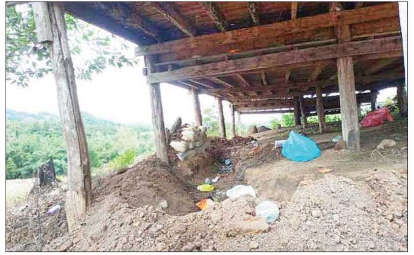
အကြမ်းဖက်သောင်းကျန်းသူများက ကျေးရွာအတွင်း လူနေအဆောက်အဦများကို အကာအကွယ်ပြု၍ တပ်မတော်စစ်ကြောင်းအား တိုက်ခိုက်ခဲ့သောနေရာ မှတ်တမ်းဓာတ်ပုံ။