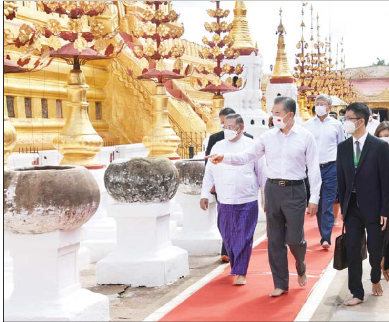
ပြည်ထောင်စုဝန်ကြီး ဦးဝဏ္ဏမောင်လွင်နှင့် တရုတ်ပြည်သူ့သမ္မတနိုင်ငံ နိုင်ငံတော် ကောင်စီဝင်နှင့် နိုင်ငံခြားရေးဝန်ကြီး မစ္စတာ ဝမ်ယီ တို့ ရွှေစည်းခုံစေတီတော်အား လှည့်လည်ဖူးမြော်ကြည့်ပါစဉ်။

ဝန်ကြီးဌာန ဒုတိယဝန်ကြီး ဦးကျော်မျိုးထွဋ်က ယနေ့ မိမိတို့ စုဝေးရောက်ရှိနေကြသည့် ချူအင် လိုင်းတန်ဆောင်းသည် မြန်မာ နိုင်ငံနှင့် တရုတ်နိုင်ငံတို့အကြား တည်ရှိခဲ့သည့် ချစ်ကြည်ရင်းနှီးမှု စာမျက်နှာ ၉ သို့