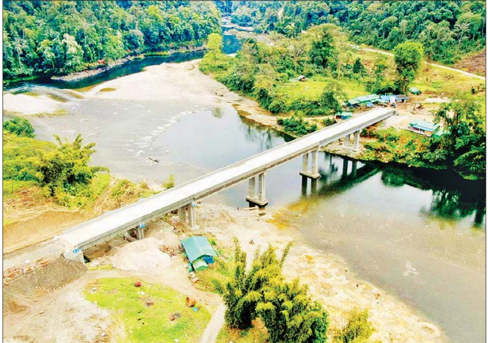
မကွေဇတံတား တည်ဆောက်ပြီးစီးမှုကို တွေ့ရစဉ်။