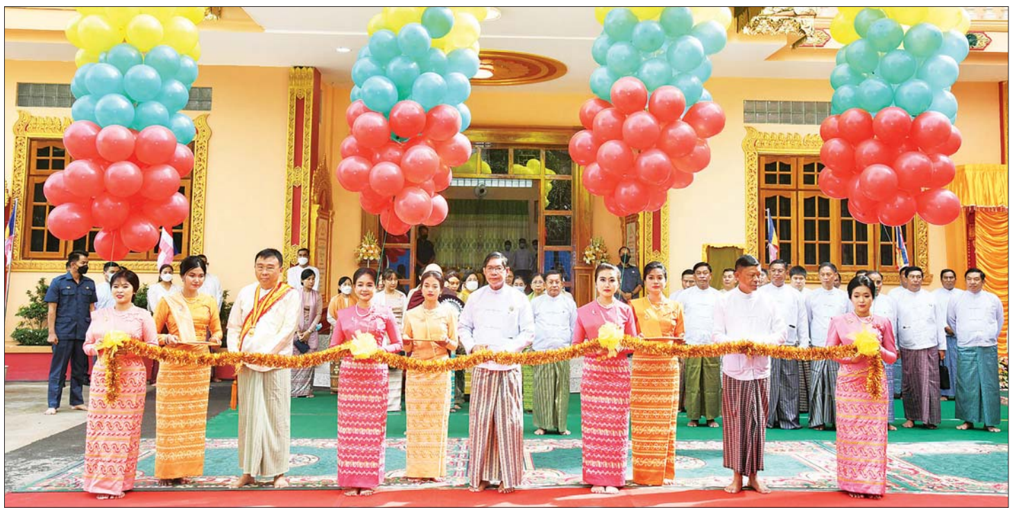
ရန်ကုန်တိုင်းဒေသကြီး ဝန်ကြီးချုပ်၊ တိုင်းမှူးနှင့် ကျောင်းဒါယကာ အလှူရှင် ဒေါက်တာ သာရင်မြတ် တို့ အခမ်းအနားကို ဖဲကြီးဖြတ်ဖွင့်လှစ်ပေးစဉ်။

ယင်းနောက် ဗုဒ္ဓသာသနံ စိရိတိဋ္ဌတု သုံးကြိမ်ရွတ်ဆိုဆုတောင်း၍ အခမ်းအနားကို ရုပ်သိမ်းခဲ့ပြီး ကျောင်းလွှတ်ပူဇာမဟာမင်္ဂလာပွဲအောင်မြင်ခြင်း အထိမ်းအမှတ်အဖြစ် ရတနာရွှေမိုးငွေမိုးများ ရွာသွန်းဖြူးကြသည်။