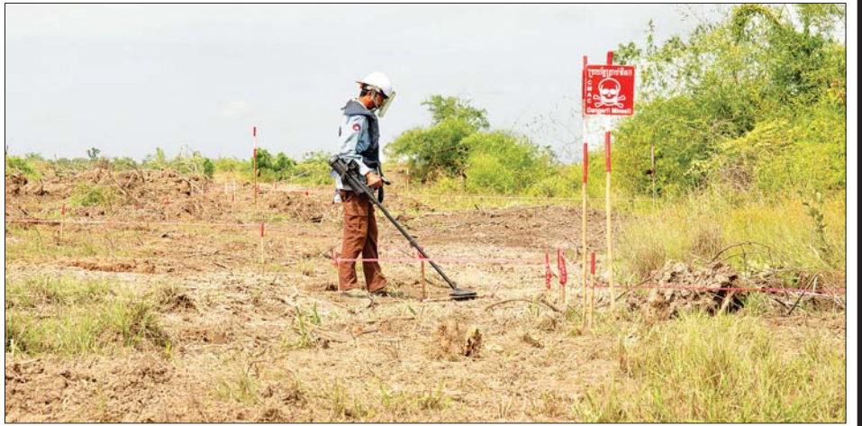
ကမ္ဘောဒီးယားနိုင်ငံအတွင်းရှိ မိုင်းကွင်းများအတွင်း မိုင်းရှင်းလင်းရေးအဖွဲ့များက မြေမြှုပ်မိုင်းများ ရှာဖွေနေစဉ်။

၁၉၉၂ ခုနှစ်မှ ၂၀၂၂ ခုနှစ် ဧပြီလအထိ ကမ္ဘောဒီးယားနိုင်ငံ၏ ဧရိယာ၂၃၇၉၀၇၇၆ဧကကိုလှိုက်စွာ အတင်းရိုက် မိုင်းအလုံးပေါင်း ၁၃၀၀၀၀ သန်း၊ တင့်ကားမိုင်း