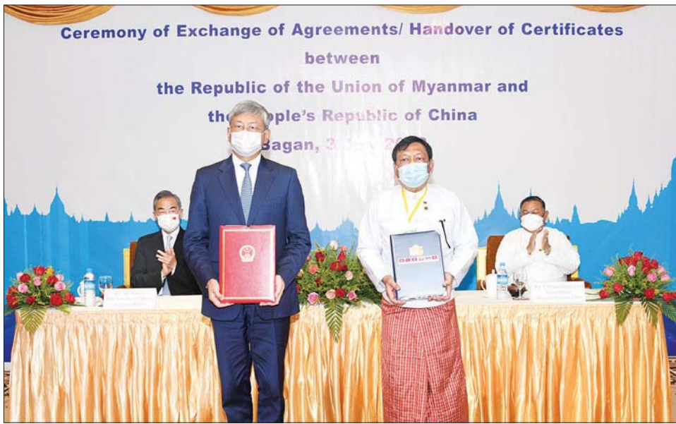
နှစ်နိုင်ငံ နိုင်ငံခြားရေးဝန်ကြီးများ၏ရှေ့မှောက်တွင် မြန်မာဘက်မှ သက်ဆိုင်ရာဝန်ကြီးဌာနများမှ ကိုယ်စားလှယ်နှင့် တရုတ်ဘက်မှ မြန်မာနိုင်ငံဆိုင်ရာ တရုတ်သံအမတ်ကြီးတို့ သဘောတူညီချက်များ လွှဲပြောင်းလဲလှယ်စဉ်။