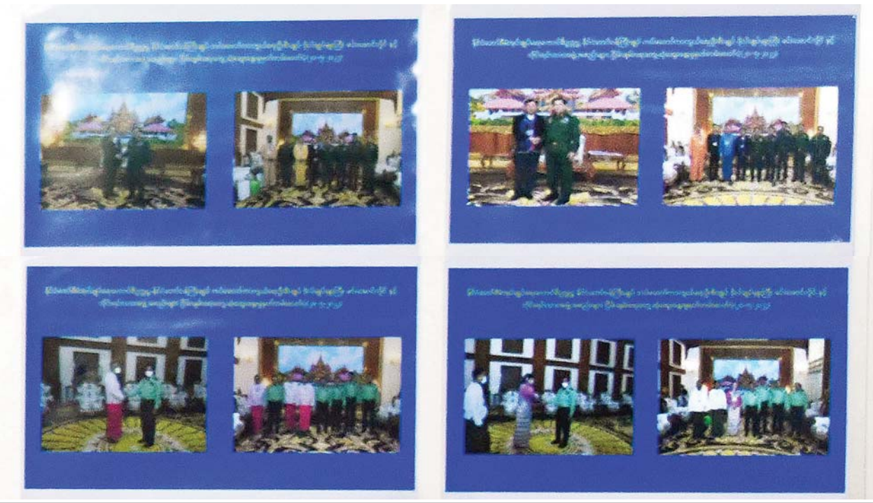
သတင်းစာရှင်းလင်းပွဲတွင် ခင်းကျင်းပြသထားသော ငြိမ်းချမ်းရေးကိစ္စရပ်များ ဆွေးနွေးသည့် မှတ်တမ်းဓာတ်ပုံများ။

ဆက်လက်ပြီး လန်ချန်း - မဲခေါင်ပူးပေါင်းဆောင်ရွက်မှု (Lanchan-Mekong Cooperation) (LMC) အစည်းအဝေးအကြောင်း ပြောမည်ဖြစ်ကြောင်း၊ မဲခေါင်မြစ်ဝကျွန်းပေါ်ဒေသသည် အာရှတွင်သာမက တစ်ကမ္ဘာလုံးတွင်ပါ ဖွံ့ဖြိုးတိုးတက်မှု အလားအလာအရှိဆုံးဒေသများအနက် တစ်ခုအပါအဝင်ဖြစ်ကြောင်း၊ မဲခေါင်မြစ်တစ်လျှောက်သည် နိုင်ငံပေါင်း ၆ နိုင်ငံနှင့် ထိစပ်ဆက်စပ်လျက်ရှိကြောင်း၊ မဲခေါင်မြစ်သည် တရုတ်နိုင်ငံနှင့် အင်ဒိုချိုင်းနားကျွန်းဆွယ်၏ အရေးကြီးသည့် နိုင်ငံဖြတ်ကျော်မြစ်ကြောင်းတစ်သွယ်ဖြစ်ကြောင်း၊ ယင်းမြစ်သည် တရုတ်နိုင်ငံ၊ ချင်းဟိုင် တိုဘက်ကုန်းမြေမြင့်တွင်မြစ်ဖျားခံ၍ တရုတ်နိုင်ငံအတွင်းရှိအပိုင်းကို လန်ချန်းမြစ်၊ ယူနန်ပြည်နယ်ပြင်ပ ပြည်မြစ်မြစ်ပိုင်းရှိ နိုင်ငံများက မဲခေါင်မြစ်ဟု ခေါ်ဝေါ်ကြကြောင်း၊ တရုတ်နိုင်ငံမှ တစ်ဆင့် မြန်မာ၊ လာအို၊ ထိုင်း၊ ကမ္ဘောဒီးယား၊ ဗီယက်နမ် နိုင်ငံများကို ဖြတ်သန်းစီးဆင်းလျက်ရှိသည့် မြစ်၏စုစုပေါင်းအရှည်သည် ကီလိုမီတာ ၄၈၈၀ ရှိပြီး မြစ်ဝှမ်းဧရိယာ ၇၉ ဒသမ ၅ သန်း စတုရန်းကီလိုမီတာရှိရာ မြစ်ဝှမ်းဒေသတွင် မှီတင်းနေထိုင်သည့် လူဦးရေသည် သန်းပေါင်း ၃၄၀ ကျော်ခန့်ရှိကြောင်း၊ မဟာမဲခေါင်ဒေသခွဲရှိ နိုင်ငံများသည် တောတောင်ရေမြေ ဆက်စပ်နေပြီး လူမှုယဉ်ကျေးမှုများ ဆက်နွယ်လျက်ရှိရာ အိမ်နီးချင်းအစဉ်အလာ ချစ်ကြည်ရေးနက်ရှိုင်းပြီး လုံခြုံရေးနှင့် ဖွံ့ဖြိုးတိုးတက်ရေး အကျိုးစီးပွားချင်း နီးကပ်ယှက်နွယ်လျက်ရှိကြောင်း၊ အဆိုပါဒေသ၏ဒေသခွဲ၏ စုစုပေါင်းဂျီဒီပီ (GDP) အမေရိကန် ဒေါ်လာ ၃ ဒသမ ၃၆ ထရီလီယံ၊ ကုန်သွယ်မှု-အမေရိကန် ဒေါ်လာ ၄၈၃ ဘီလီယံနှင့် ရင်းနှီးမြှုပ်နှံမှု အမေရိကန်ဒေါ်လာ ၁ ဒသမ ၃၆ ဘီလီယံတို့ဖြစ်ကြောင်းကို စာရင်းဇယားများ၊ မှတ်တမ်းများအရ လေ့လာသိရှိရကြောင်း။