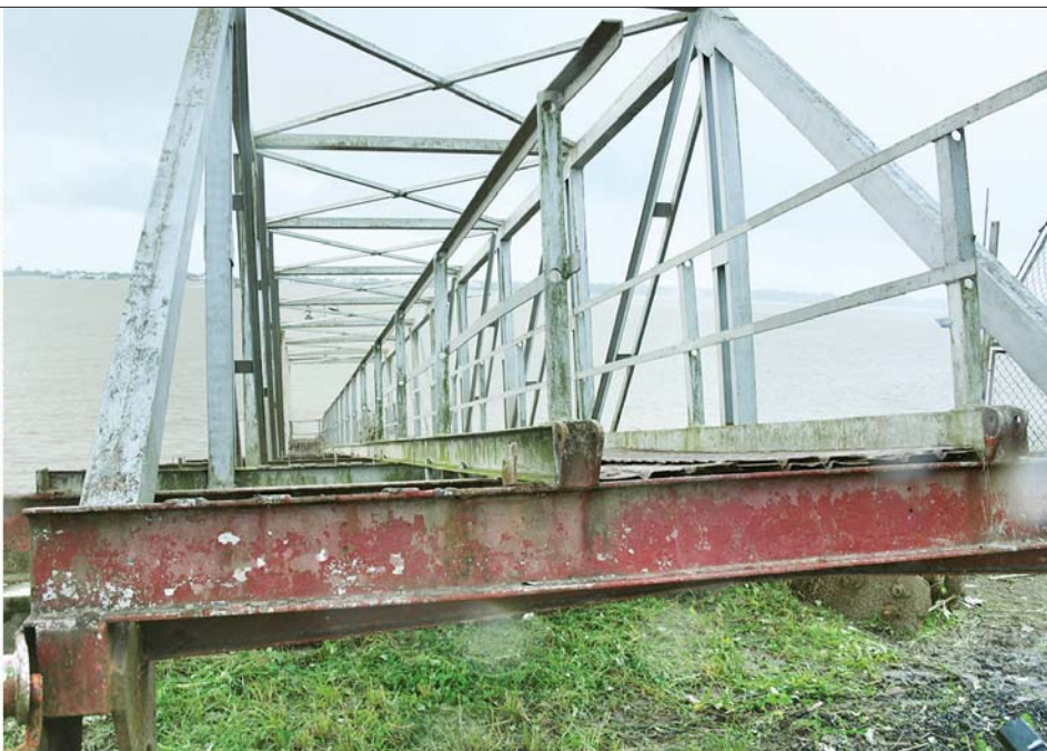
နိုင်ငံတော်စီမံအုပ်ချုပ်ရေးကောင်စီဥက္ကဋ္ဌ နိုင်ငံတော်ဝန်ကြီးချုပ် ဗိုလ်ချုပ်မှူးကြီး မင်းအောင်လှိုင် ဆိပ်ခံတံတားအား ကြည့်ရှုစစ်ဆေးစဉ်။