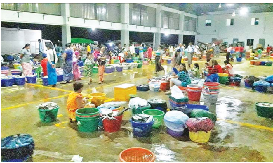
မြိတ်မြို့ ငါးလေလံဈေးကြီးအတွင်း ငါးအရောင်းအဝယ်ပြုလုပ်နေသူများ။