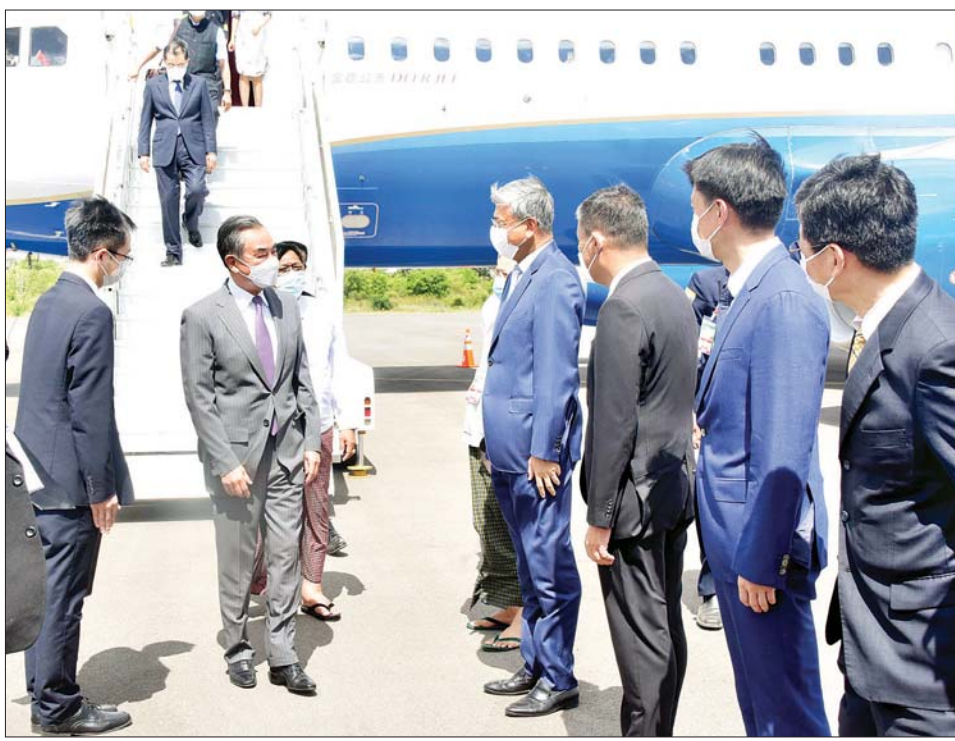
နိုင်ငံခြားရေး ဝန်ကြီးဌာန နှင့် နိုင်ငံခြားရေးဝန်ကြီး H.E. Mr. Wang Yi နှင့်အတူ (၇)ကြိမ်မြောက် မဲခေါင် - လန်ချန်း ပူးပေါင်းဆောင်ရွက်မှု နိုင်ငံခြားရေးဝန်ကြီးများအစည်းအဝေးကို ပူးတွဲဥက္ကဋ္ဌအဖြစ် တာဝန်ယူဆောင်ရွက်သွားမည်ဖြစ်ကြောင်း သိရသည်။ သတင်းစဉ်

နေပြည်တော် ဇူလိုင် ၂ မြန်မာနိုင်ငံက ပူးတွဲဥက္ကဋ္ဌအဖြစ် တာဝန်ယူလျက် အိမ်ရှင်အဖြစ် လက်ခံကျင်းပမည့် (၇) ကြိမ်မြောက် မဲခေါင်-လန်ချန်း ပူးပေါင်းဆောင်ရွက်မှု နိုင်ငံခြားရေးဝန်ကြီးများအစည်းအဝေးသို့ တက်ရောက်ရန်အတွက် တရုတ်ပြည်သူ့သမ္မတနိုင်ငံ နိုင်ငံတော်ကောင်စီဝင်နှင့် နိုင်ငံခြားရေးဝန်ကြီး H.E. Mr. Wang Yi ခေါင်းဆောင်သော ကိုယ်စားလှယ်အဖွဲ့သည် ယနေ့တွင် အထူးလေယာဉ်ဖြင့် ညောင်ဦးလေဆိပ်သို့ ရောက်ရှိလာခဲ့ရာ နိုင်ငံခြားရေးဝန်ကြီးဌာန ဒုတိယဝန်ကြီး ဦးကျော်မျိုးထွဋ်၊ မန္တလေးတိုင်းဒေသကြီး သယံဇာတနှင့် သဘာဝပတ်ဝန်းကျင်ထိန်းသိမ်းရေးဝန်ကြီး ဦးမျိုးအောင်၊ သံတမန်ရေးရာဦးစီးဌာန ညွှန်ကြားရေးမှူးချုပ် ဦးဝဏ္ဏဟန်နှင့် သက်ဆိုင်ရာတာဝန်ရှိသူတို့က လေဆိပ်၌ ကြိုဆိုခဲ့ကြသည်။ (အပေါ်ယာပုံ)