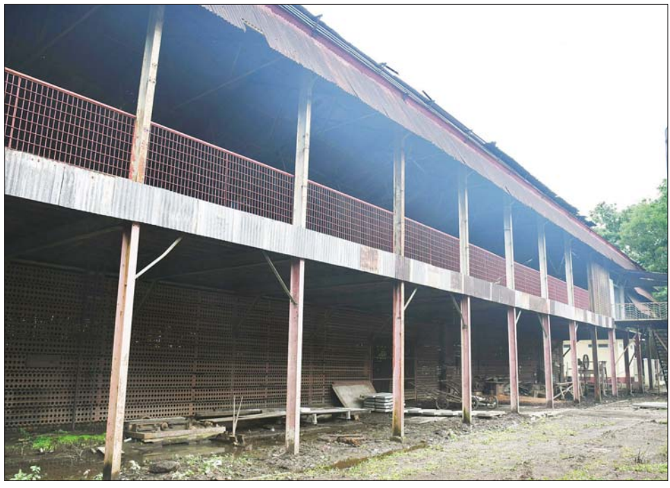
ဒလသဘောကျင်းအတွင်းရှိ အဆောက်အအုံများကို တွေ့ရစဉ်။