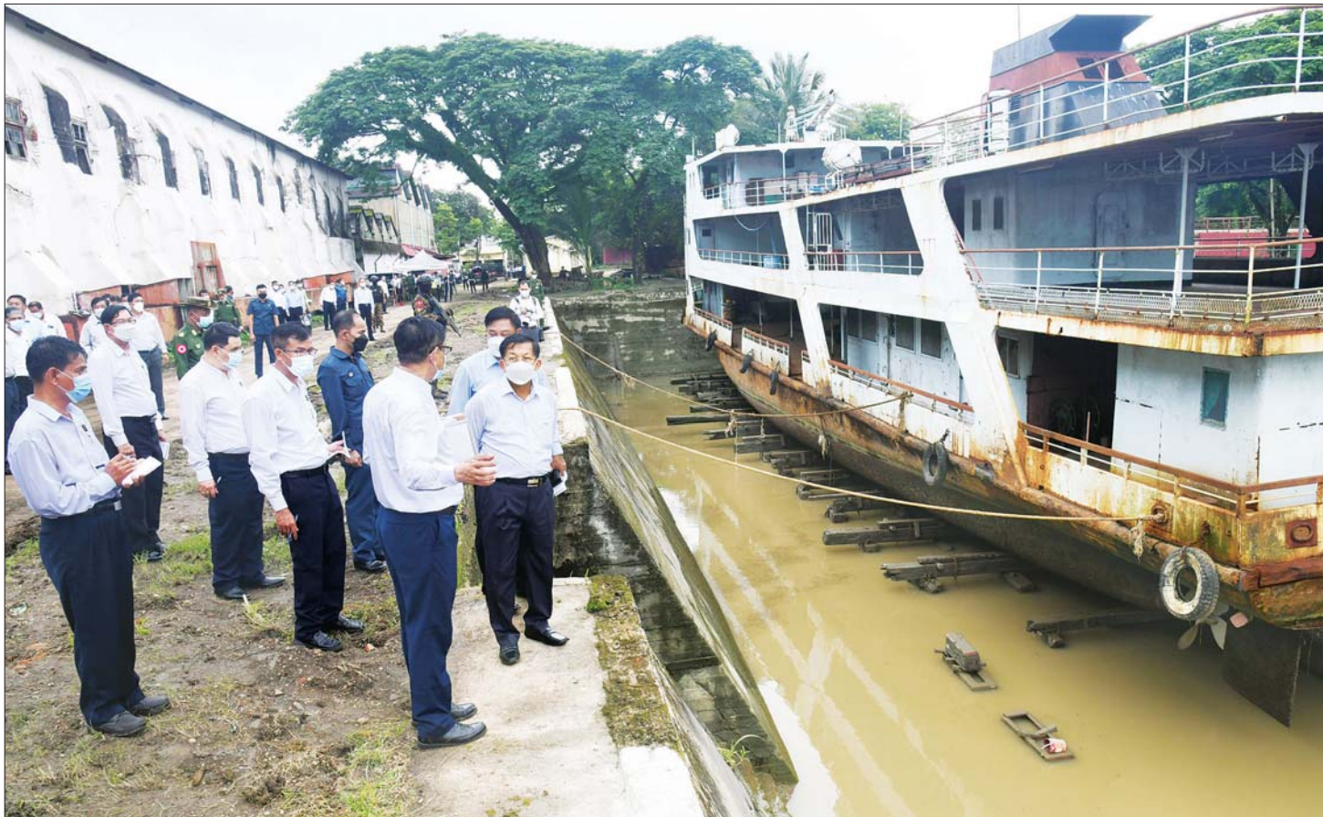
နိုင်ငံတော်စီမံအုပ်ချုပ်ရေးကောင်စီဥက္ကဋ္ဌ နိုင်ငံတော်ဝန်ကြီးချုပ် ဗိုလ်ချုပ်မှူးကြီး မင်းအောင်လှိုင် ရန်ကုန်တိုင်းဒေသကြီး ဒလသင်္ဘောကျင်းအတွင်း ကြည့်ရှုစစ်ဆေးစဉ်။

ဆောင်ရွက်နေမှု၊ ရေယာဉ်များ အသစ်တည်ဆောက် ခဲ့မှုနှင့် လာမည့်ဘဏ္ဍာနှစ်များတွင် ရေယာဉ်ပြုပြင် ခြင်းလုပ်ငန်းများ ဆောင်ရွက်သွားမည့် အခြေအနေ၊ ရည်မှန်းချက်တာဝန်များအပေါ် အကောင်အထည် ဖော်ဆောင်ရွက်သွားမည့် အခြေအနေများကိုလည်း ကောင်း ရှင်းလင်းတင်ပြကြသည်။ နိုင်ငံတော်အတွက် များစွာအကျိုးရှိမည် ရှင်းလင်းတင်ပြမှုများအပေါ် နိုင်ငံတော်စီမံ အုပ်ချုပ်ရေးကောင်စီဥက္ကဋ္ဌ နိုင်ငံတော်ဝန်ကြီးချုပ် က နိုင်ငံတော်အတွက် ပို့ဆောင်ရေးကဏ္ဍတွင် စာမျက်နှာ ၅ သို့