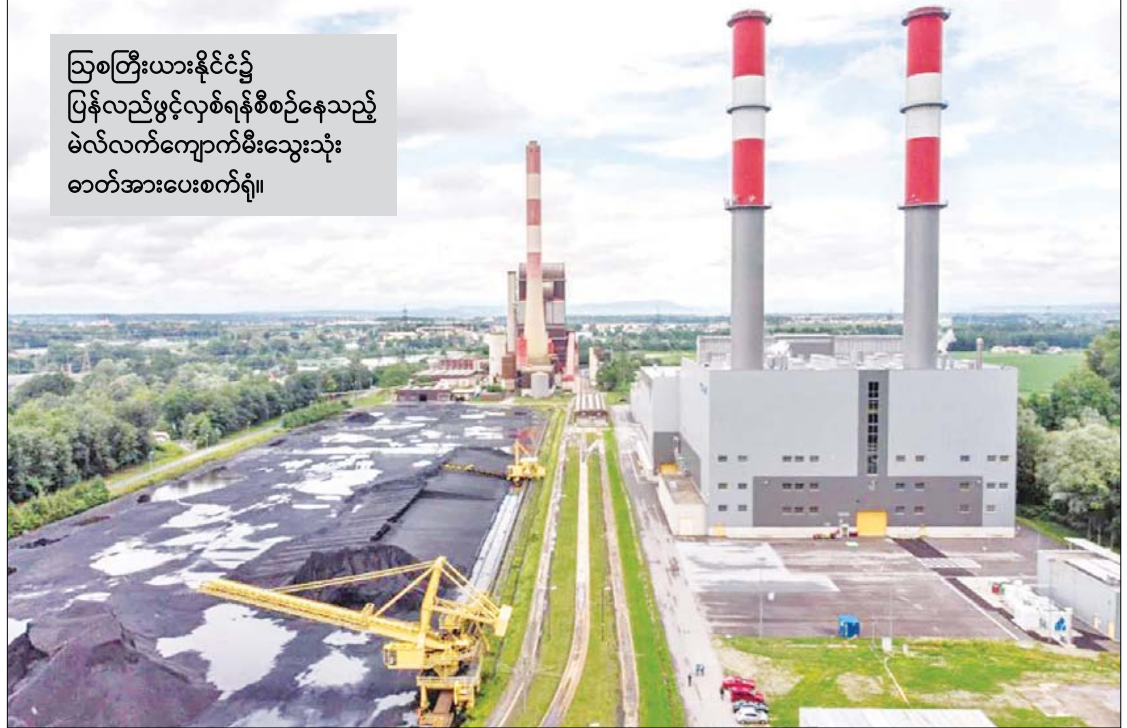
ဩစတြီးယားနိုင်ငံ၌ ပြန်လည်ဖွင့်လှစ်ရန်စီစဉ်နေသည့် မဲလ်လက်ကျောက်မီးသွေးသုံးဓာတ်အားပေးစက်ရုံ။

* ရာသီဥတုပြောင်းလဲမှုဆိုင်ရာ တိုက်ဖျက်ရေးအတွက် ဩစတြီးယားနိုင်ငံသည် ကျောက်မီးသွေးအသုံးပြုမှုကို ရပ်တန့်ရန် ကြိုးစားခဲ့သော်လည်း အချည်းနှီးသာ။ စစ်ရေးဆိုင်ရာပဋိပက္ခများကြောင့် ဓာတ်ငွေ့ထောက်ပံ့မှုကို မရနိုင်တော့သည့်အတွက် ဥရောပနိုင်ငံများသည် ကျောက်မီးသွေးဘက်သို့ ပြန်လှည့်လာရသည့် အနေအထားသို့ ပြန်လည်ရောက်ရှိလာခဲ့သည် * ယခုအခါတွင် မဲလ်လက်ဓာတ်အားပေးစက်ရုံ၏ အနီရောင်နှင့် အဖြူရောင် မီးခိုးခေါင်းတိုင်များသည် ဂရစ်မြို့အဝေးတစ်နေရာရှိ ပြောင်းဖူးခင်းနှင့် ဖရိုခင်းများအကြားတွင် ထင်ရှားစွာပေါ်လွင်နေသည်