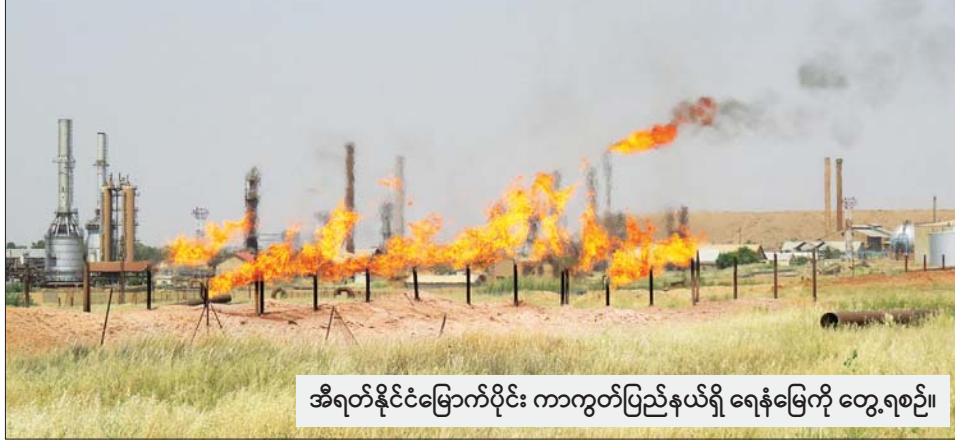
အီရတ်နိုင်ငံမြောက်ပိုင်း ကာကွတ်ပြည်နယ်ရှိ ရေနံမြေကို တွေ့ရစဉ်။

အီရတ်နိုင်ငံ၏ စီးပွားရေးသည် ရေနံစိမ်းစည်ပေါ်မှ အဓိက မှီခိုနေရပြီး ရေနံတင်ပို့မှုမှ နိုင်ငံငွေ၏ ၉၀ ရာခိုင်နှုန်း ကျော် ရရှိလျက်ရှိသည်။ ဆင်ဟွာ