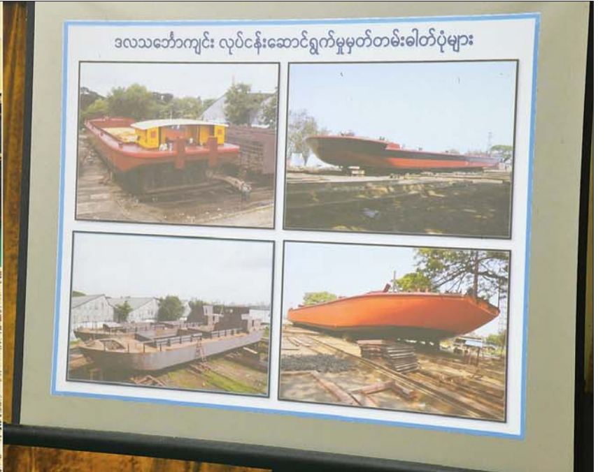
နိုင်ငံတော်စီမံအုပ်ချုပ်ရေးကောင်စီဥက္ကဋ္ဌ နိုင်ငံတော်ဝန်ကြီးချုပ် ဗိုလ်ချုပ်မှူးကြီး မင်းအောင်လှိုင် အား ပြည်ထောင်စုဝန်ကြီး ဗိုလ်ချုပ်ကြီး တင်အောင်စန်းက ဒလသင်္ဘောကျင်း၏ လုပ်ငန်းဆောင်ရွက်မှု အခြေအနေများ ရှင်းလင်းတင်ပြစဉ်။

နေပြည်တော် ဇူလိုင် ၂ နိုင်ငံတော်စီမံအုပ်ချုပ်ရေးကောင်စီဥက္ကဋ္ဌ နိုင်ငံတော် ဝန်ကြီးချုပ် ဗိုလ်ချုပ်မှူးကြီး မင်းအောင်လှိုင်သည် ခရီးစဉ်တွင်လိုက်ပါလာသည့် အဖွဲ့ဝင်များ၊ ရန်ကုန် တိုင်းဒေသကြီး ဝန်ကြီးချုပ်၊ ရန်ကုန်တိုင်းစစ်ဌာနချုပ် တိုင်းမှူး၊ မြို့တော်ဝန်နှင့် တာဝန်ရှိသူများ လိုက်ပါ၍ ယနေ့နံနက်ပိုင်းတွင် ရန်ကုန်တိုင်းဒေသကြီး ဒလ သင်္ဘောကျင်းသို့ သွားရောက်ကြည့်ရှုစစ်ဆေးသည်။ ဦးစွာ အစည်းအဝေးခန်းမတွင် ပို့ဆောင်ရေးနှင့် ဆက်သွယ်ရေးဝန်ကြီးဌာန ပြည်ထောင်စုဝန်ကြီး ဗိုလ်ချုပ်ကြီး တင်အောင်စန်းက ပြည်တွင်းရေကြောင်း