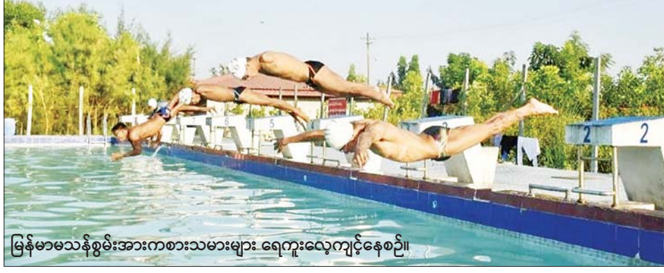
မြန်မာမသန်စွမ်းအားကစားသမားများ ရေကူးလေ့ကျင့်နေစဉ်။

ရန်ကုန် ဇူလိုင် ၂ (၁၁) ကြိမ်မြောက် အာဆီယံမသန်စွမ်းအားကစားပြိုင်ပွဲ (Asean Paragame) ကို အင်ဒိုနီးရှားနိုင်ငံ ဆိုလိုမြို့ Central Java တွင် ဇူလိုင် ၃၀ ရက်မှ ဩဂုတ် ၆ ရက်အထိ ကျင်းပမည်ဖြစ်ကြောင်း သိရသည်။ စာမျက်နှာ ၂၅ ကော်လံ ၁ *