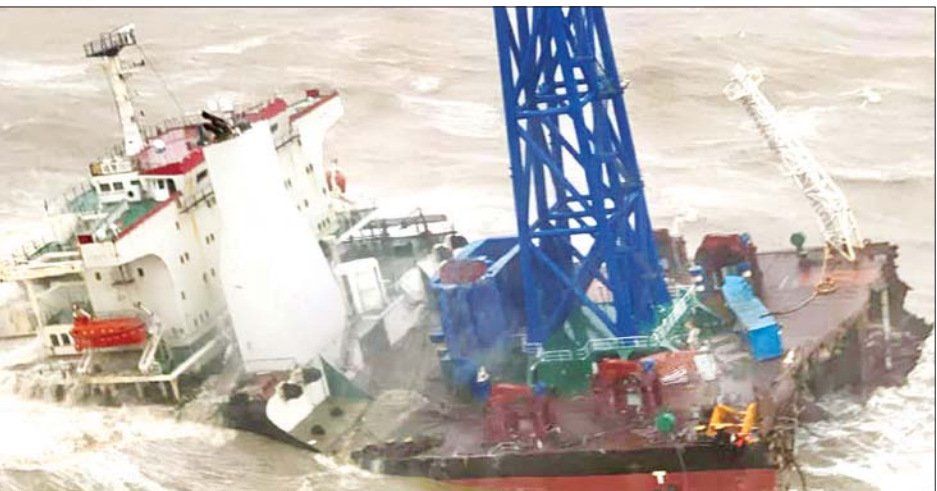
တိုင်ဖွန်းမုန်တိုင်းတိုက်ခတ်မှုကြောင့် တောင်တရုတ်ပင်လယ်အတွင်း နစ်မြုပ်ပျက်စီးသွားသည့် သင်္ဘောကို တွေ့ရစဉ်။