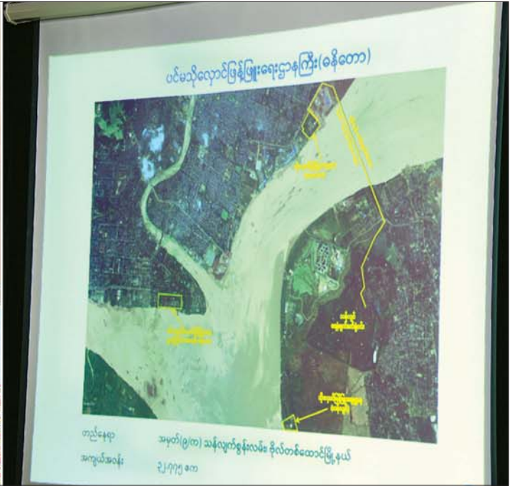
နိုင်ငံတော်စီမံအုပ်ချုပ်ရေးကောင်စီဥက္ကဋ္ဌ နိုင်ငံတော်ဝန်ကြီးချုပ် ဗိုလ်ချုပ်မှူးကြီး မင်းအောင်လှိုင် အား ပြည်ထောင်စုဝန်ကြီး ဦးသောင်းဟန်က ပင်မသိုလှောင်ဖြန့်ဖြူးရေးဌာနကြီး ရန်ကုန်(ခနိတော)၏ သမိုင်းအကျဉ်းနှင့် သိုလှောင်နိုင်မှု အခြေအနေများ ရှင်းလင်းတင်ပြစဉ်။

နေပြည်တော် ဇူလိုင် ၂ နိုင်ငံတော်စီမံအုပ်ချုပ်ရေးကောင်စီဥက္ကဋ္ဌ နိုင်ငံတော်ဝန်ကြီးချုပ် ဗိုလ်ချုပ်မှူးကြီး မင်းအောင်လှိုင်သည် ခရီးစဉ်တွင် လိုက်ပါလာသည့် အဖွဲ့ဝင်များ၊ ရန်ကုန်တိုင်းဒေသကြီး ဝန်ကြီးချုပ်၊ ရန်ကုန်တိုင်းစစ်ဌာနချုပ်