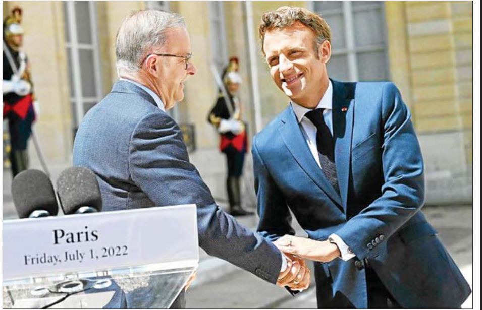
ဩစတြေးလျဝန်ကြီးချုပ် အန်သိုနီ အယ်ဘာနစ်နှင့် ပြင်သစ်သမ္မတ အီမန် နူရယ် မက်ခရူန်။

ယမန်နှစ်က ဩစတြေးလျ ဝန်ကြီးချုပ်ဟောင်း စကော့ မာရီဆွန်သည် ပြင်သစ်ပိုင် သင်္ဘောတည်ဆောက်သူ ရေတပ်အုပ်စုနှင့် ဒေါ်လာဘီလီယံ ပေါင်းများစွာတန်ကြေးရှိသော ဒီဇယ်စွမ်းအင်သုံး ရေငုပ်သင်္ဘောများမှာယူမှု စာချုပ်ကို ဖျက်သိမ်းခဲ့မှု နှင့်ပတ်သက်ပြီး နှစ်နိုင်ငံကြား ဆက်ဆံရေး အေးစက်ခဲ့ကြောင်း သိရသည်။ အင်န်အိတ်ချ်ကေ