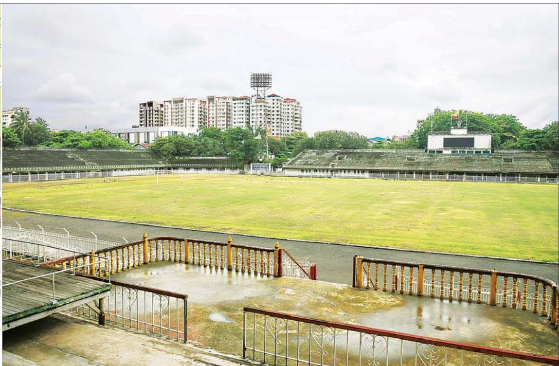
နိုင်ငံတော်စီမံအုပ်ချုပ်ရေးကောင်စီဥက္ကဋ္ဌ နိုင်ငံတော်ဝန်ကြီးချုပ် ဗိုလ်ချုပ်မှူးကြီး မင်းအောင်လှိုင် ရန်ကုန်တိုင်းဒေသကြီး မင်္ဂလာတောင်ညွန့်မြို့နယ်ရှိ အောင်ဆန်းအားကစားပြိုင်ဝင်း အဆင့်မြှင့်တင်တည်ဆောက်နိုင်မည့် အခြေအနေများ ကြည့်ရှုစစ်ဆေးစဉ်။

နေပြည်တော် ဇူလိုင် ၂ နိုင်ငံတော်စီမံအုပ်ချုပ်ရေးကောင်စီဥက္ကဋ္ဌ နိုင်ငံတော်ဝန်ကြီးချုပ် ဗိုလ်ချုပ်မှူးကြီး မင်းအောင်လှိုင်သည် နိုင်ငံတော်စီမံအုပ်ချုပ်ရေးကောင်စီဝင် ဗိုလ်ချုပ်ကြီး တင်အောင်စန်း၊ ကောင်စီတွဲဖက်အတွင်းရေးမှူး ဒုတိယဗိုလ်ချုပ်ကြီး ရဲဝင်းဦး၊ ပြည်ထောင်စုဝန်ကြီးများဖြစ်ကြသည့် ဦးသောင်းဟန်၊ ဦးမင်းသိန်းဇံ၊ ဦးရွှေလေး၊ ရန်ကုန်တိုင်းဒေသကြီးဝန်ကြီးချုပ် ဦးစိုးသိန်း၊ ကာကွယ်ရေးဦးစီးချုပ်ရုံးမှ တပ်မတော်အရာရှိကြီးများ၊ ရန်ကုန်တိုင်းစစ်ဌာနချုပ် တိုင်းမှူး၊ မြို့တော်ဝန်နှင့် တာဝန်ရှိသူများ လိုက်ပါ၍ ယနေ့နံနက်ပိုင်းတွင် ရန်ကုန်တိုင်းဒေသကြီး မင်္ဂလာတောင်ညွန့်မြို့နယ်ရှိ အောင်ဆန်းအားကစားပြိုင်ဝင်း အဆင့်မြှင့်တင်တည်ဆောက်နိုင်မည့် အခြေအနေများကို သွားရောက်ကြည့်ရှုစစ်ဆေးသည်။ စာမျက်နှာ ၃ ကော်လံ ၁*