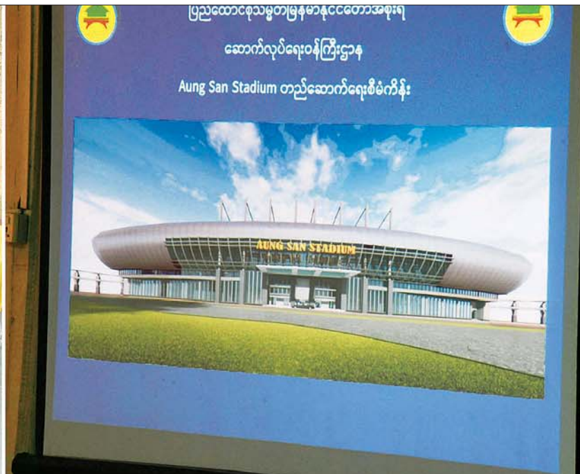
နိုင်ငံတော်စီမံအုပ်ချုပ်ရေးကောင်စီဥက္ကဋ္ဌ နိုင်ငံတော်ဝန်ကြီးချုပ် ဗိုလ်ချုပ်မှူးကြီး မင်းအောင်လှိုင် အား အောင်ဆန်းအားကစားပြိုင်ဝင်း အဆင့်မြှင့်တင်တည်ဆောက်နိုင်မည့် အခြေအနေများနှင့်ပတ်သက်ပြီး ပြည်ထောင်စုဝန်ကြီး ဦးမင်းသိန်းဇံ က ရှင်းလင်းတင်ပြစဉ်။