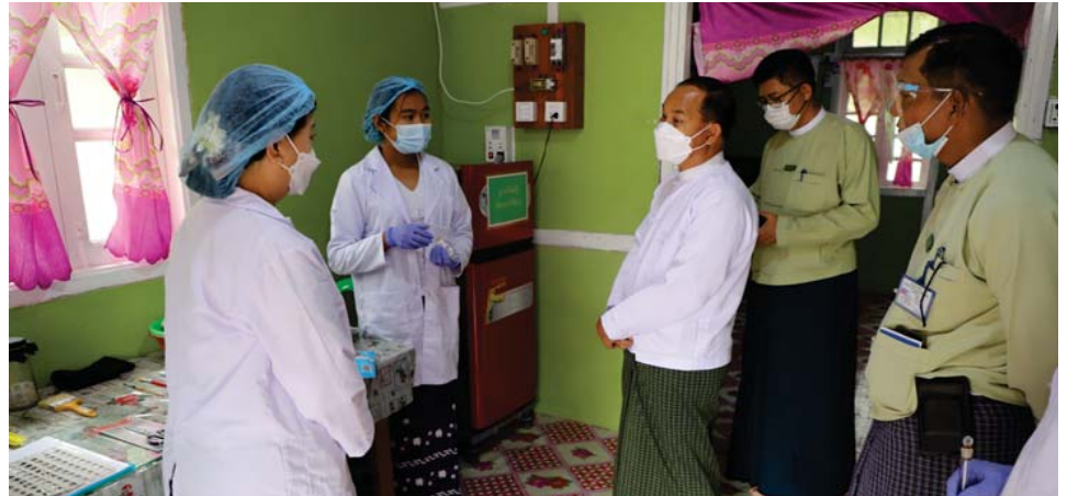
ဥကုပ်ပါးနကျယ် မွေးမြူရေးဓာတ်ခွဲခန်းတွင် တိုင်းဒေသကြီးဝန်ကြီးချုပ် ကြည့်ရှုစစ်ဆေးစဉ်။ တိုင်းဒေသကြီး စိုက်ပျိုးရေးဦးစီးဌာနရုံးရှိ တောင်သူ စစ်ဆေးခဲ့သည်။ ပညာပေး ICT Studio အခန်းကိုလည်း ကြည့်ရှု တိုင်းဒေသကြီး (ပြန်/ဆက်)

လျာထားချက်ပြည့်မီအောင် စိုက်ပျိုးနိုင်ရေး မှာကြားသည်။ ထို့နောက် တိုင်းဒေသကြီးဝန်ကြီးချုပ်သည် မုံရွာခရိုင် စိုက်ပျိုးရေးဦးစီးဌာနရုံးရှိ ဥကုပ်ပါးနကျယ် မွေးမြူရေးဓာတ်ခွဲခန်းမှ ဆန်ထွေးပိုးမွေးမြူခန်းနှင့် ဥကုပ်ပါးနကျယ် မွေးမြူထုတ်လုပ်မှုဆိုင်ဆိုင်ကို လည်းကောင်း၊ Home Garden စိုက်ခင်းအောင်မြင် ဖြစ်ထွန်းနေမှုကိုလည်းကောင်း၊ မှိုမျိုးစုံ-မျိုးစေ့နှင့် စိုက်ထုတ်သုတေသနပြုစမ်းသပ်ခန်းတွင် မှိုမျိုးစုံ မျိုးစေ့ထုတ်လုပ်နေမှုကိုလည်းကောင်း ကြည့်ရှု စစ်ဆေးခဲ့သည်။ ဆက်လက်၍ တိုင်းဒေသကြီး စိုက်ပျိုးရေး ဦးစီးဌာနရုံးသို့သွားရောက်ပြီး ပြခန်းတွင်ပြသထား သော မျိုးကောင်းမျိုးသန့်များ၊ သဘာဝမြေဩဇာများ၊ သွင်းအားစုများကို လိုက်လံကြည့်ရှုအားပေးကာ