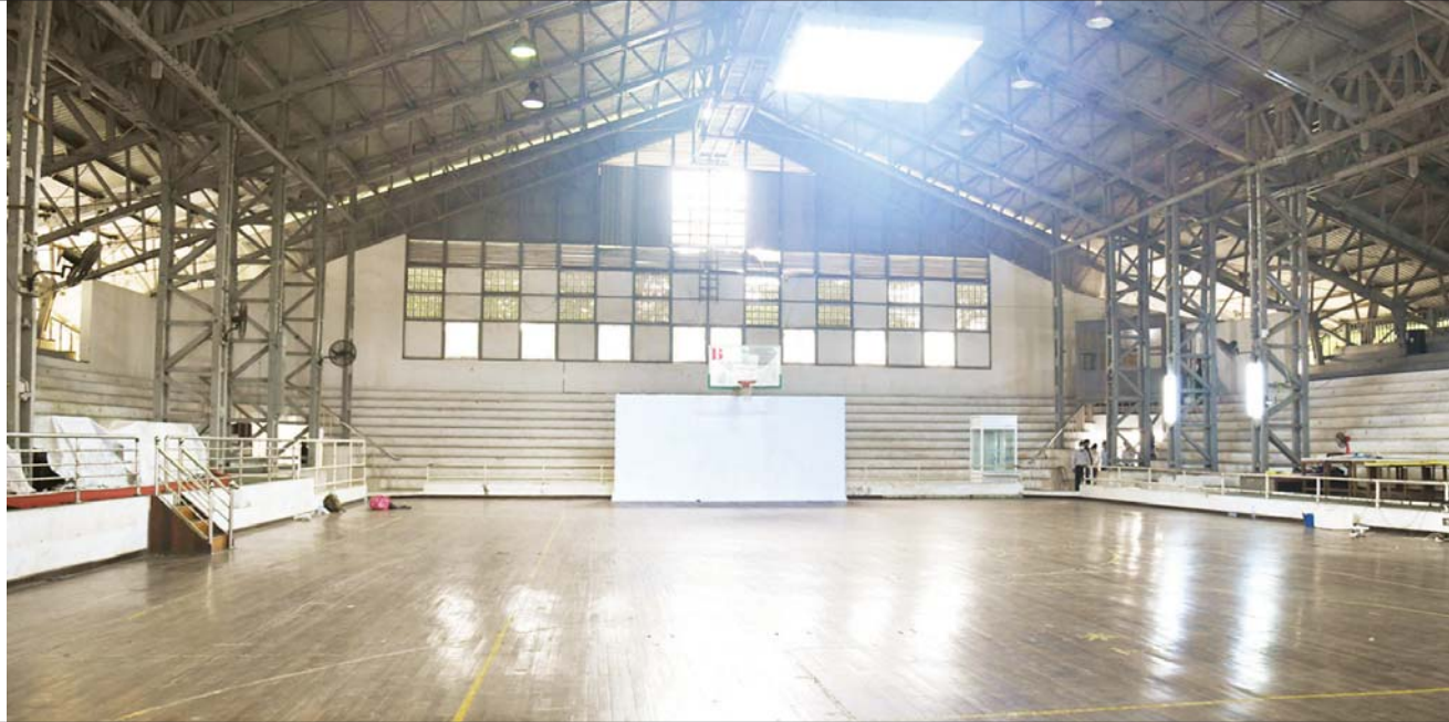
နိုင်ငံတော်စီမံအုပ်ချုပ်ရေးကောင်စီဥက္ကဋ္ဌ နိုင်ငံတော်ဝန်ကြီးချုပ် ဗိုလ်ချုပ်မှူးကြီး မင်းအောင်လှိုင် ရန်ကုန်မြို့ အောင်ဆန်းအားကစားပြိုင်ဝင်းအတွင်းရှိ မိုးလုံလေလုံ အားကစားရုံကို ကြည့်ရှုစစ်ဆေးစဉ်။